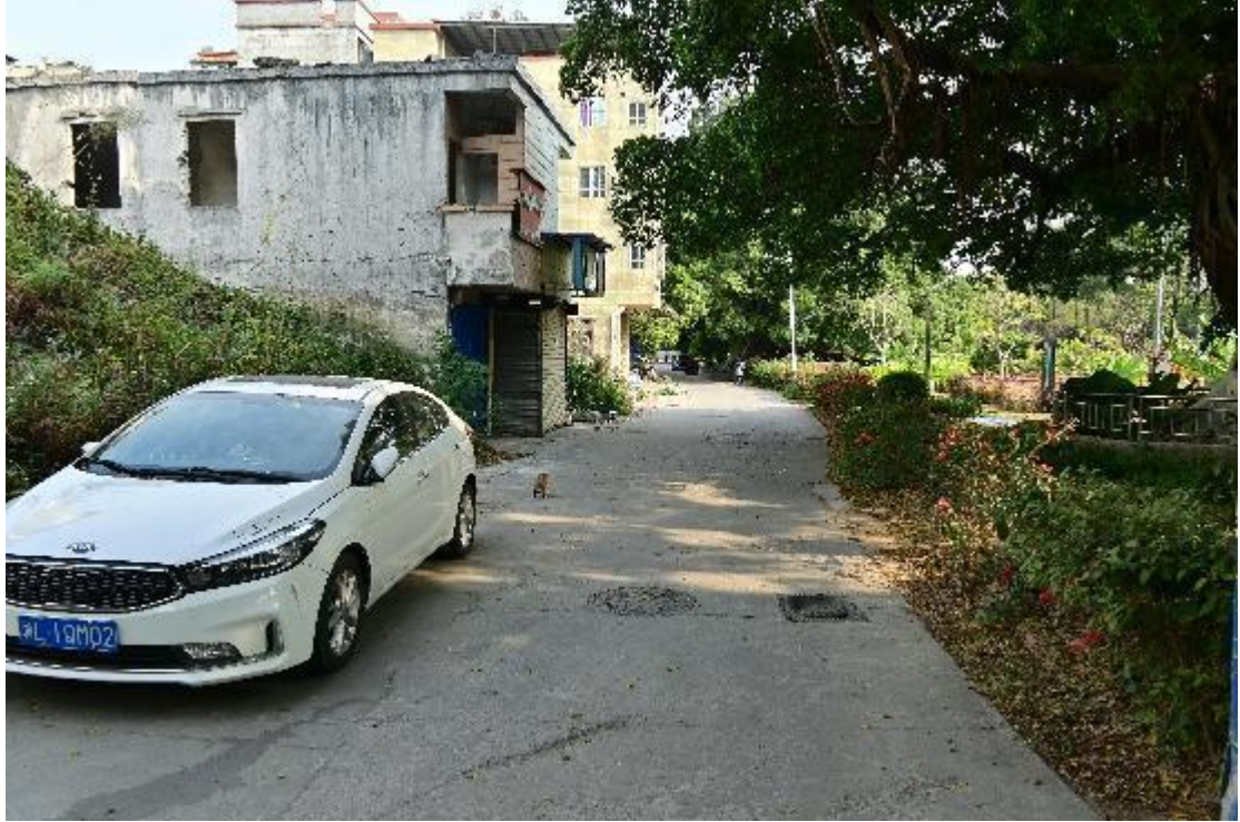
图 14 地块内现状（西北-东南）