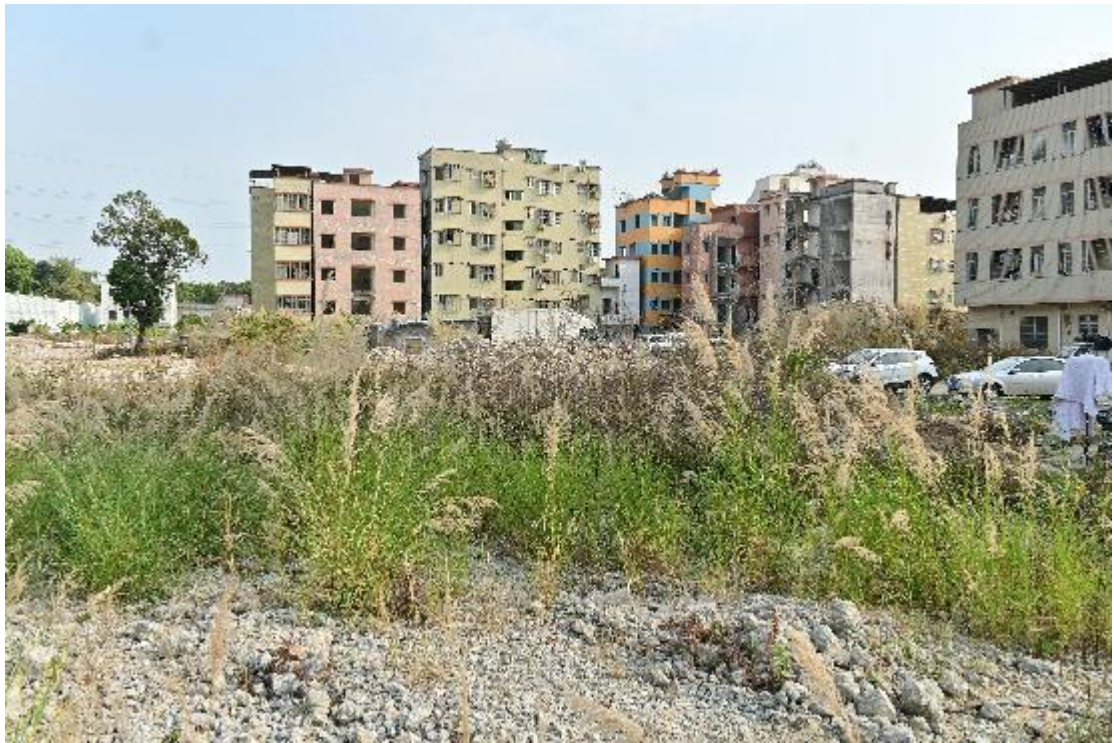
图 13 地块内现状（西北-东南）