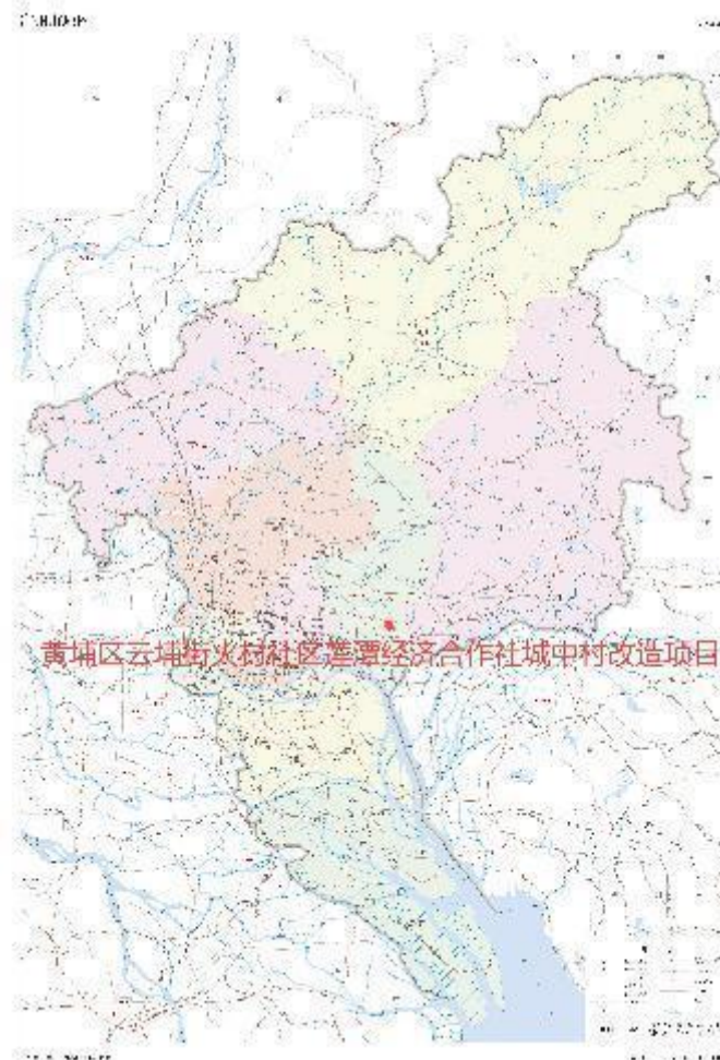
图 1 项目地块在广州市位置示意图（广州市规划和自然资源局）

根据《中华人民共和国文物保护法》《广州市文物保护规定》，按照《广州市文物局关于黄埔区云埔街火村社区莲潭经济合作社城中村改造项目考古调查勘探工作的复函》（文物 20250046 号）指导意见，受广州市黄埔区云埔街火村社区经济联合社、广州市黄埔区云埔街火村社区莲潭经济合作社委托，由我院负责该项目的考古调查工作。