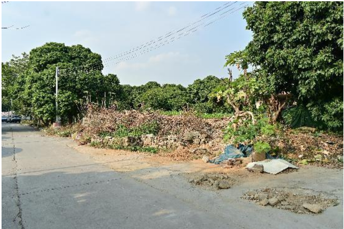
图 19 地块内现状（西南-东北）