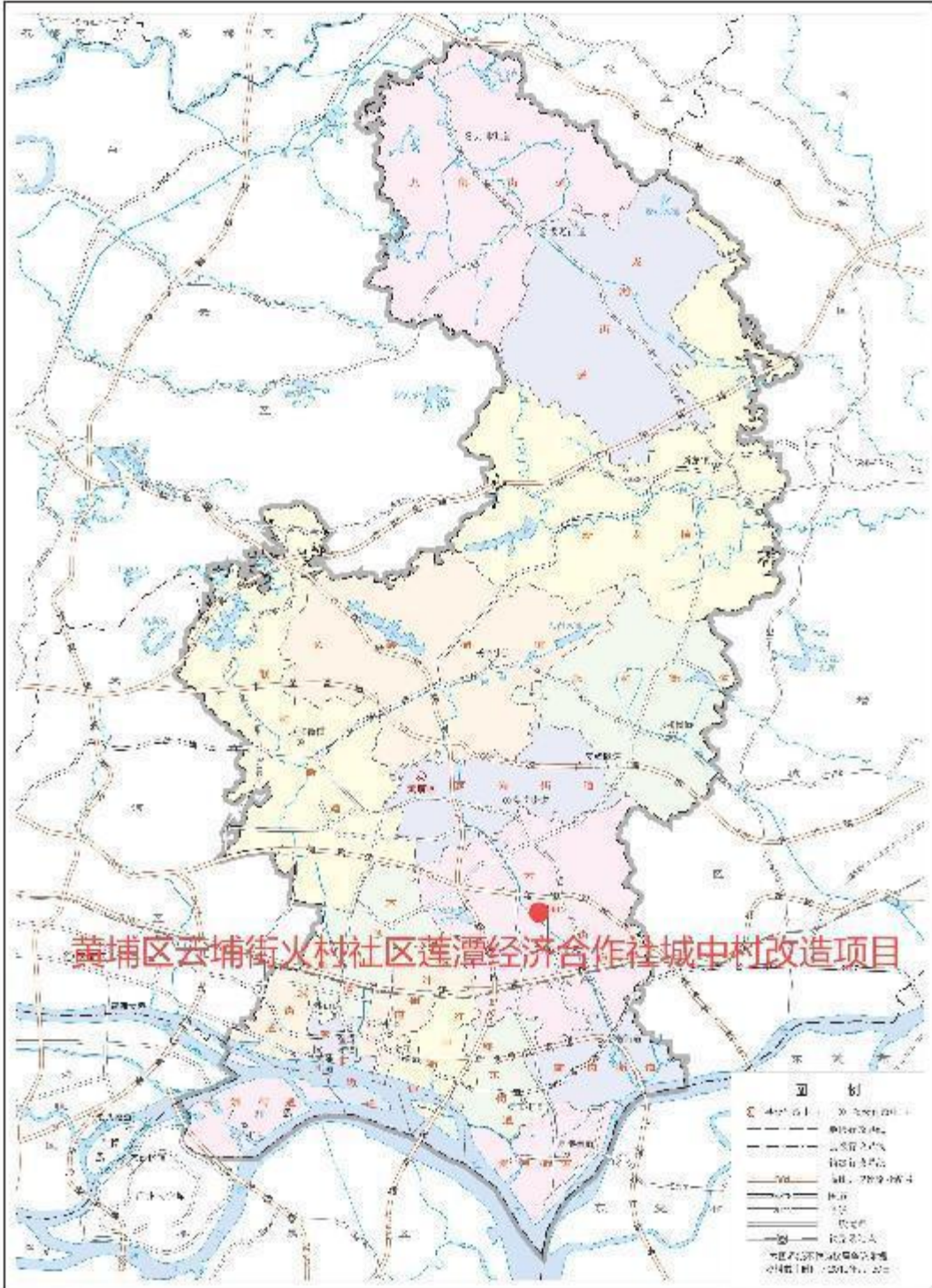
图 2 项目地块在黄埔区位置示意图 (广州市规划和自然资源局)