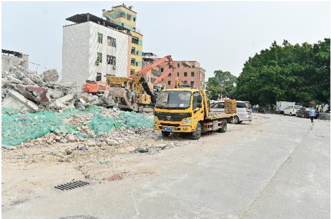
图 15 地块内现状（西北-东南）