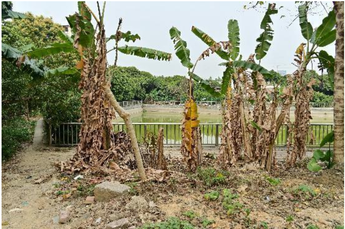
图 17 地块内现状（西南-东北）