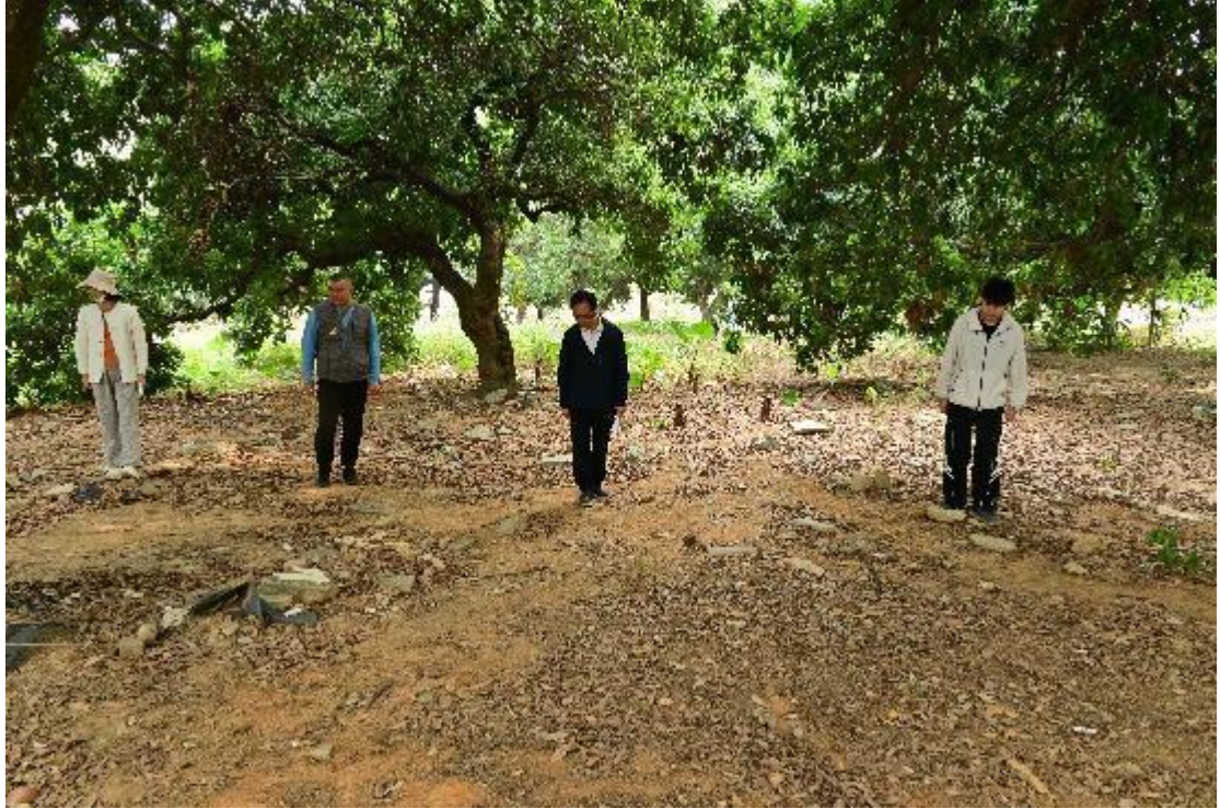
图 6 现场踏查（西北-东南）