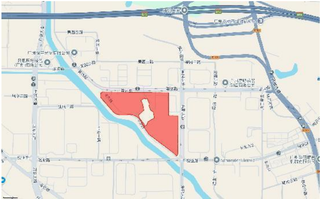
图 3 项目地块周边环境示意图（奥维地图，红色阴影为本次调查范围）