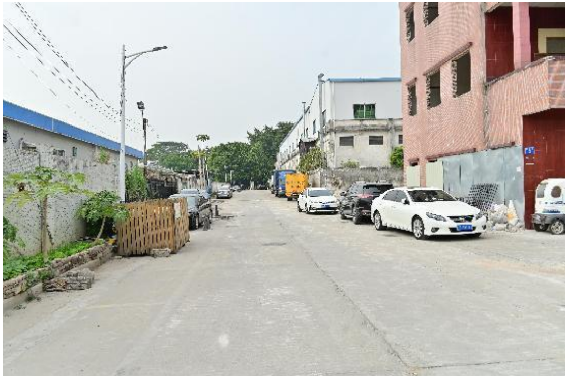
图 7 地块内现状（东南-西北）