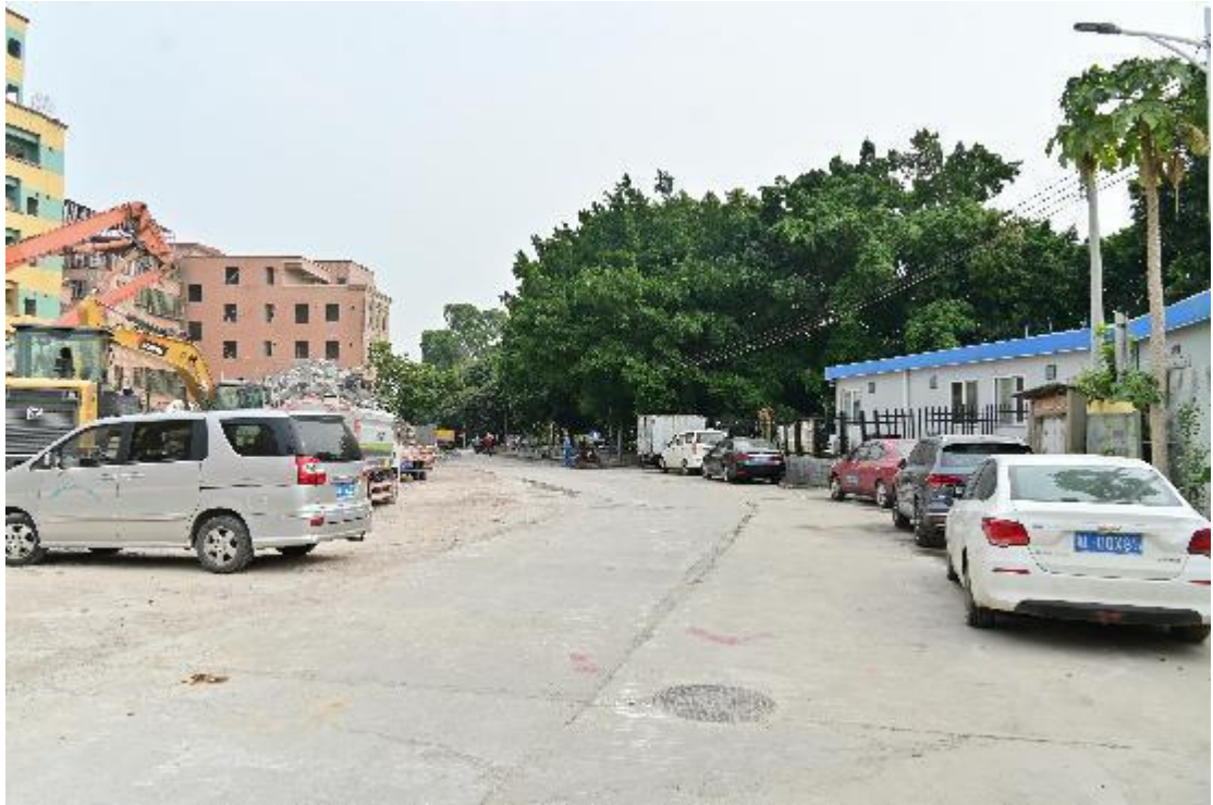
图 11 地块内现状（西北-东南）