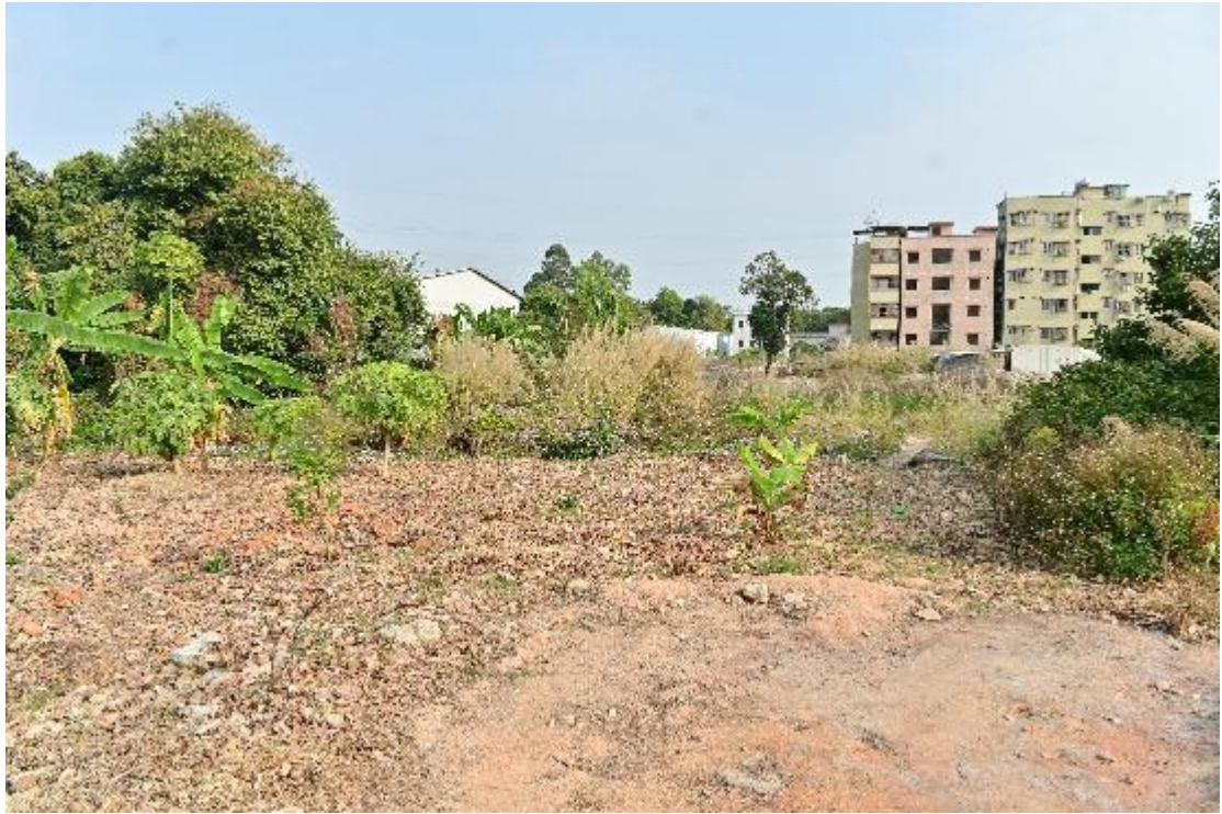
图 12 地块内现状（西北-东南）