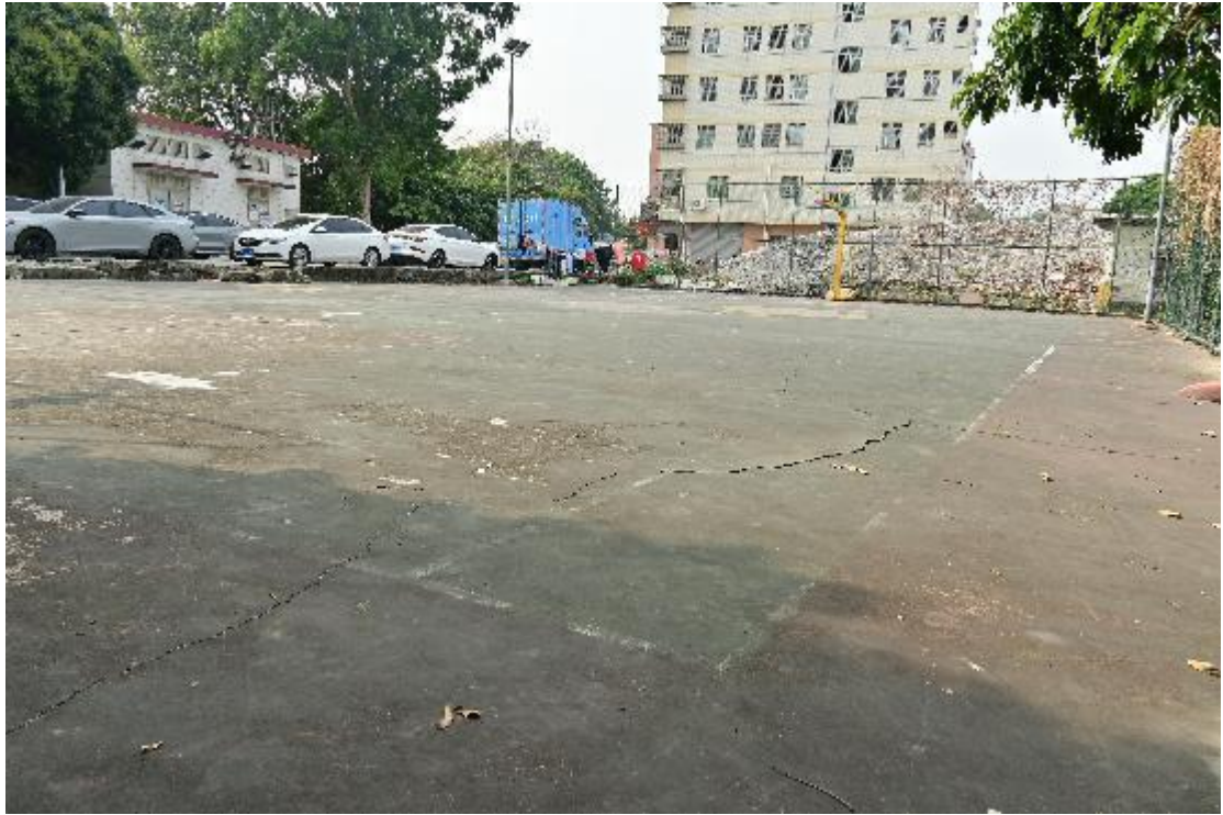
图 8 地块内现状（东-西）