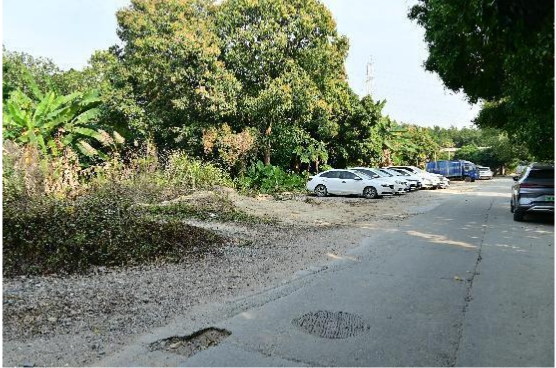
图 16 地块内现状（西-东）