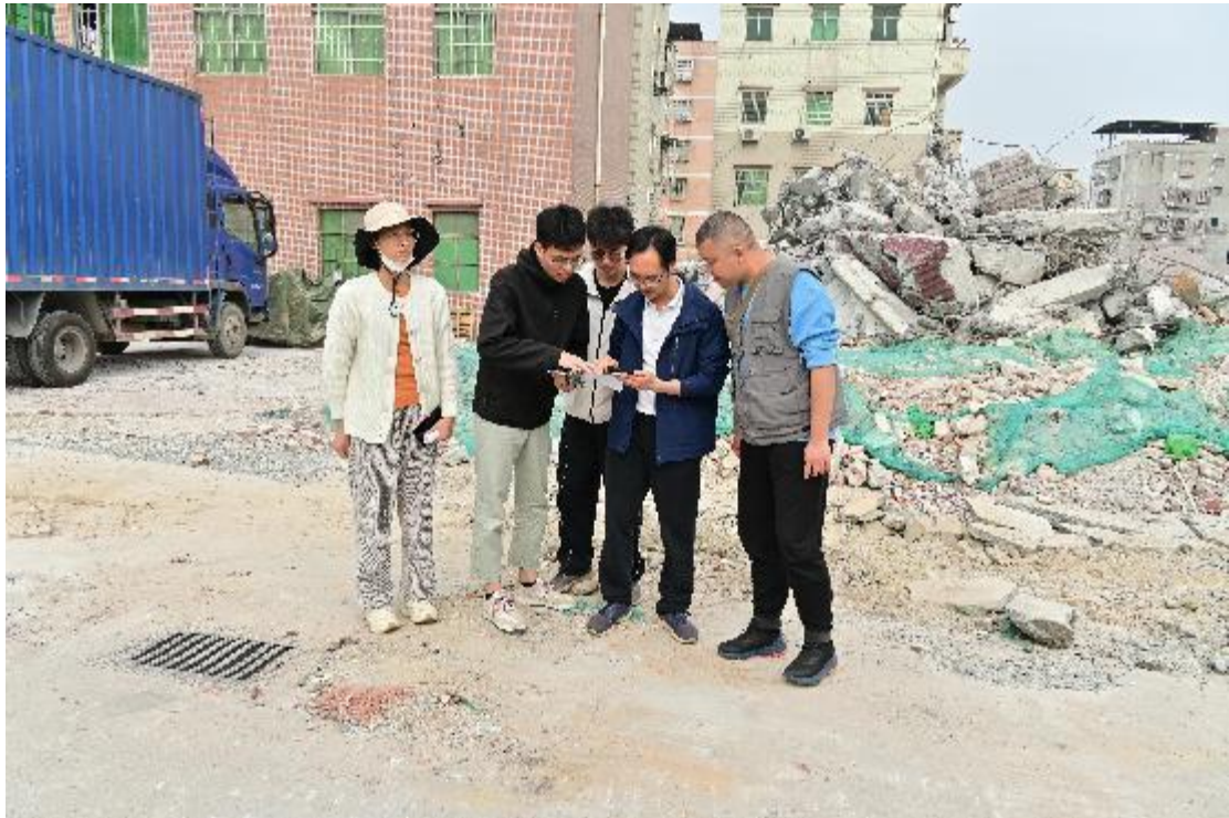
图 5 工作人员确认地块范围（西南-东北）