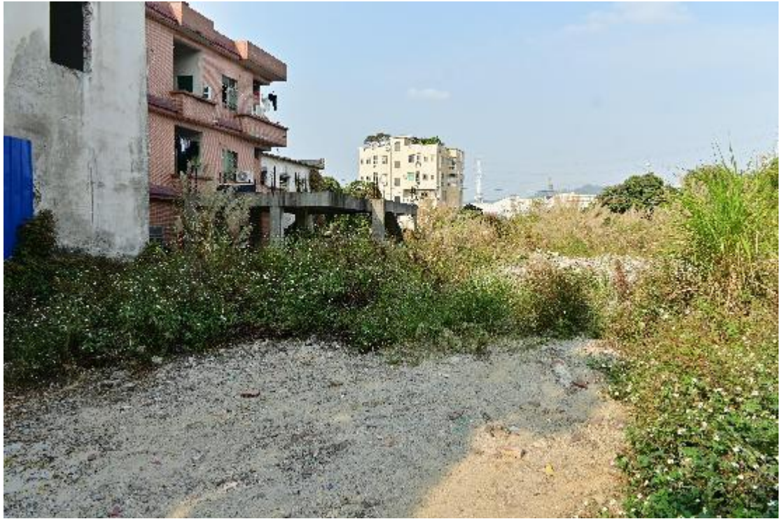
图 10 地块内现状（南-北）