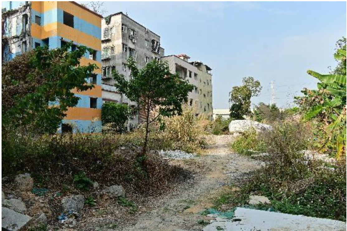
图 9 地块内现状（南-北）