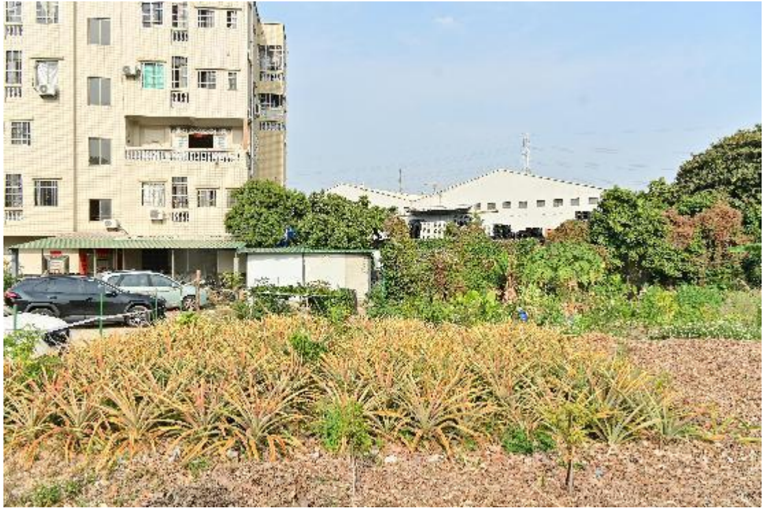
图 18 地块内现状（西南-东北）