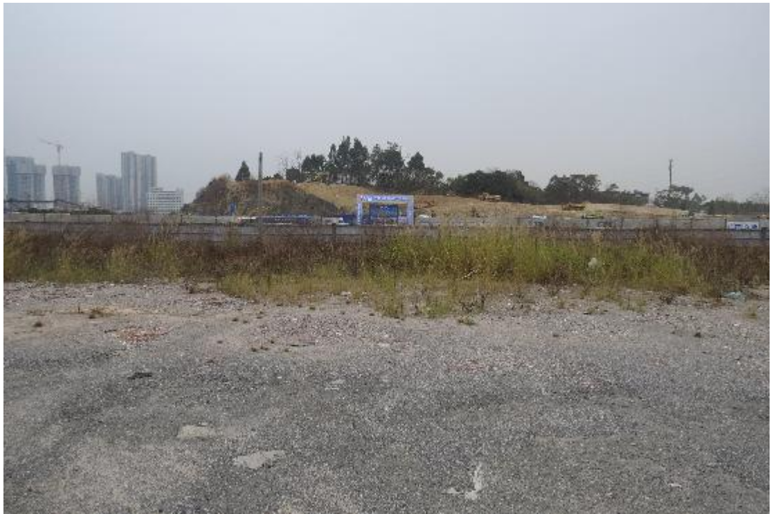
图 29 地块内横三路现状（北-南）