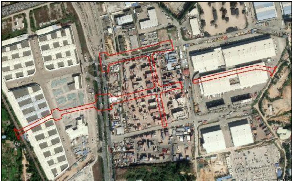
图 4 项目地块卫星红线图 (奥维地图)