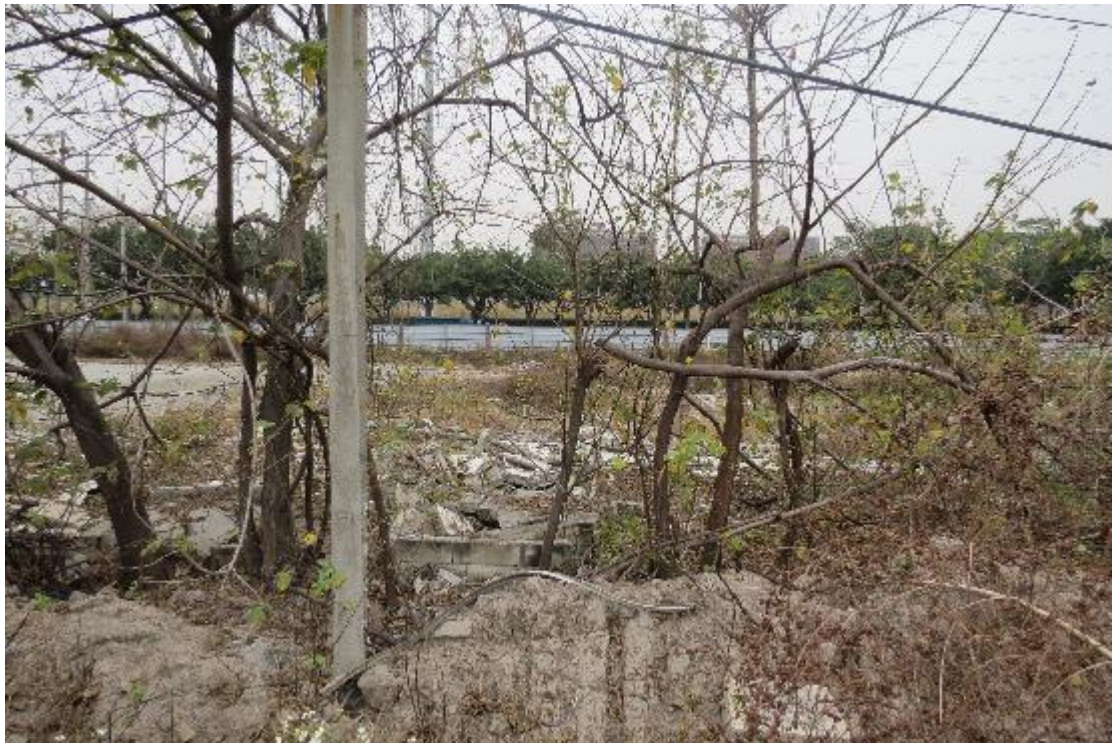
图 17 地块内横三路现状（东-西）