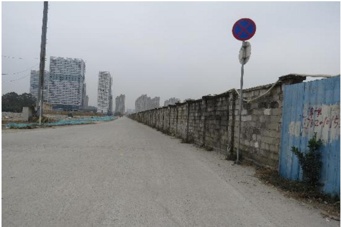
图 11 地块内横二路现状（西-东）