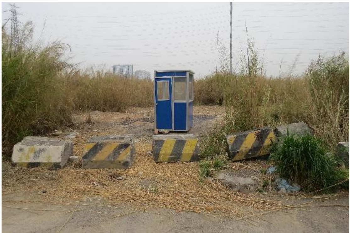
图 27 地块内横三路现状（西-东）