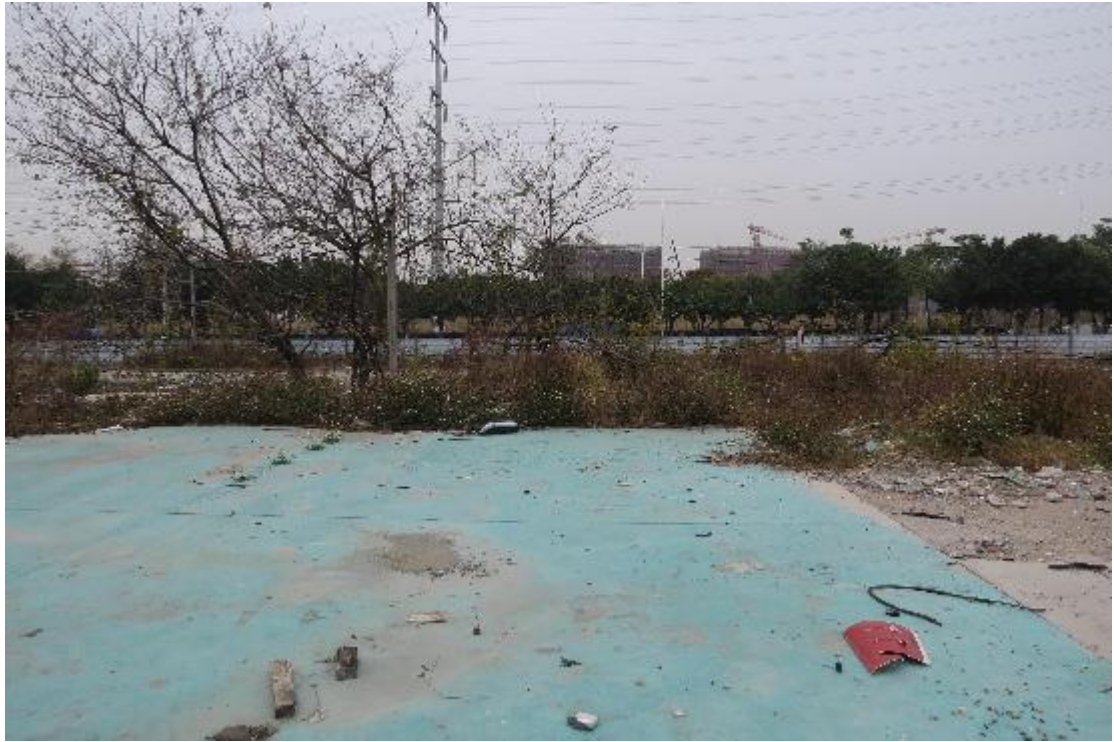
图 16 地块内横三路现状（东-西）