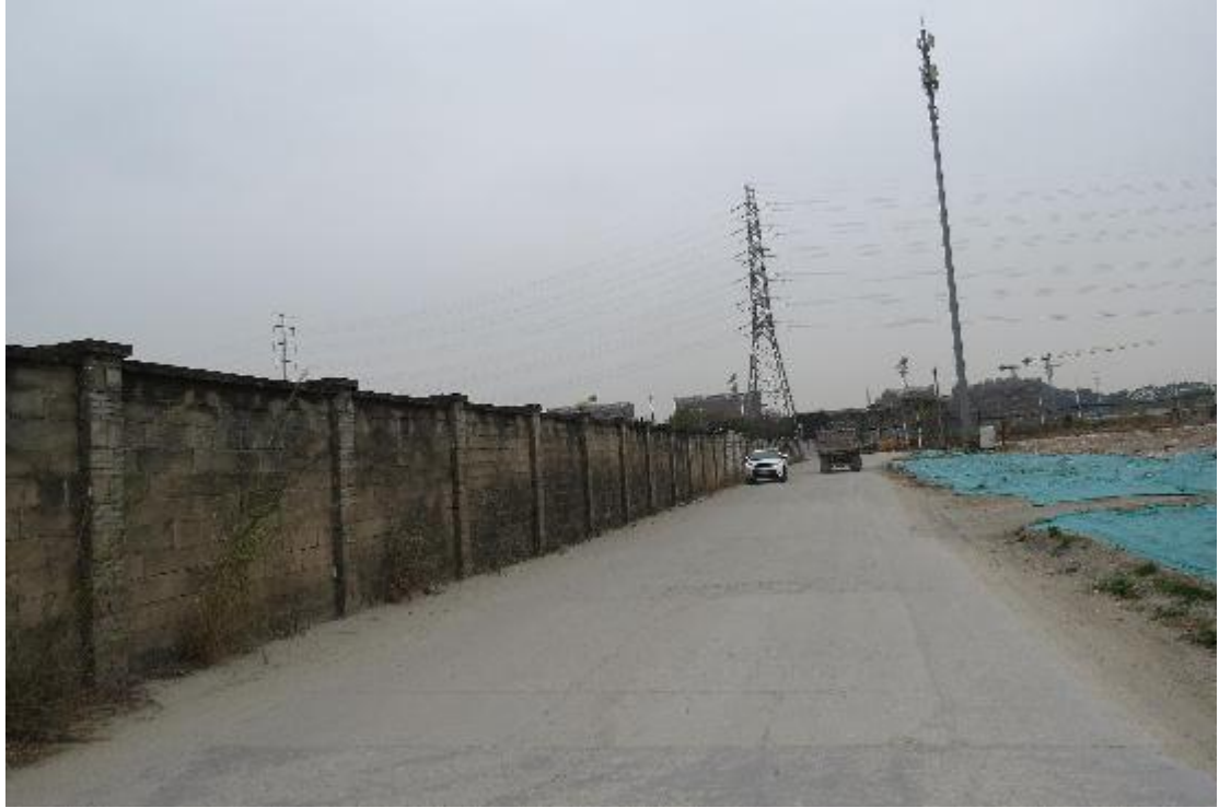
图 8 地块内横二路现状（东-西）