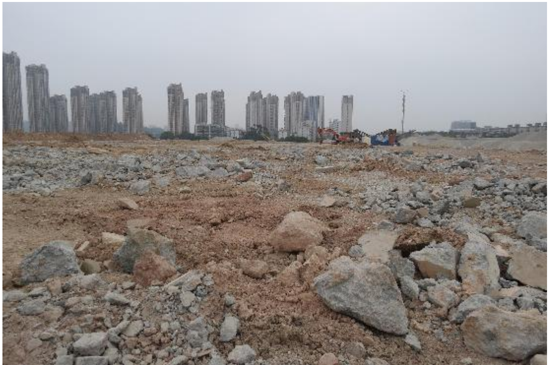
图 23 地块内横三路现状（西-东）