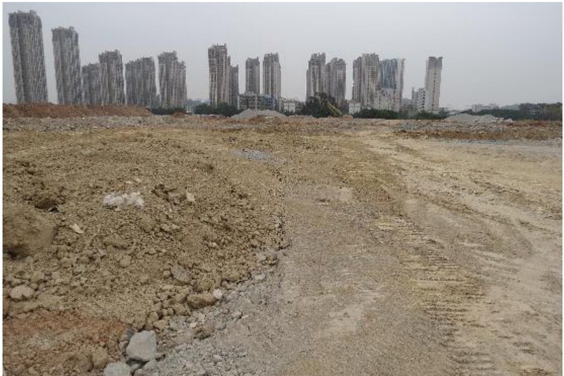
图 25 地块内横三路现状（西-东）