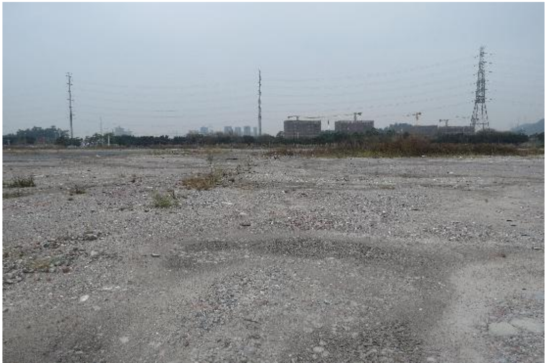
图 13 地块内横三路现状（东-西）