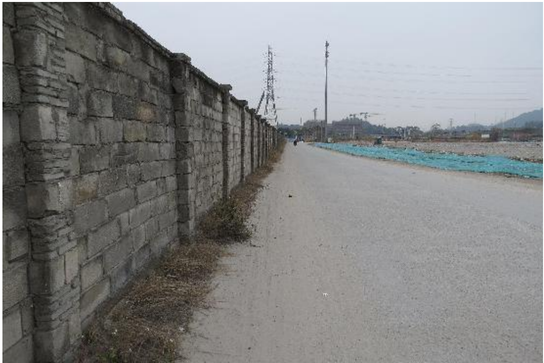
图 7 地块内横二路现状（东-西）