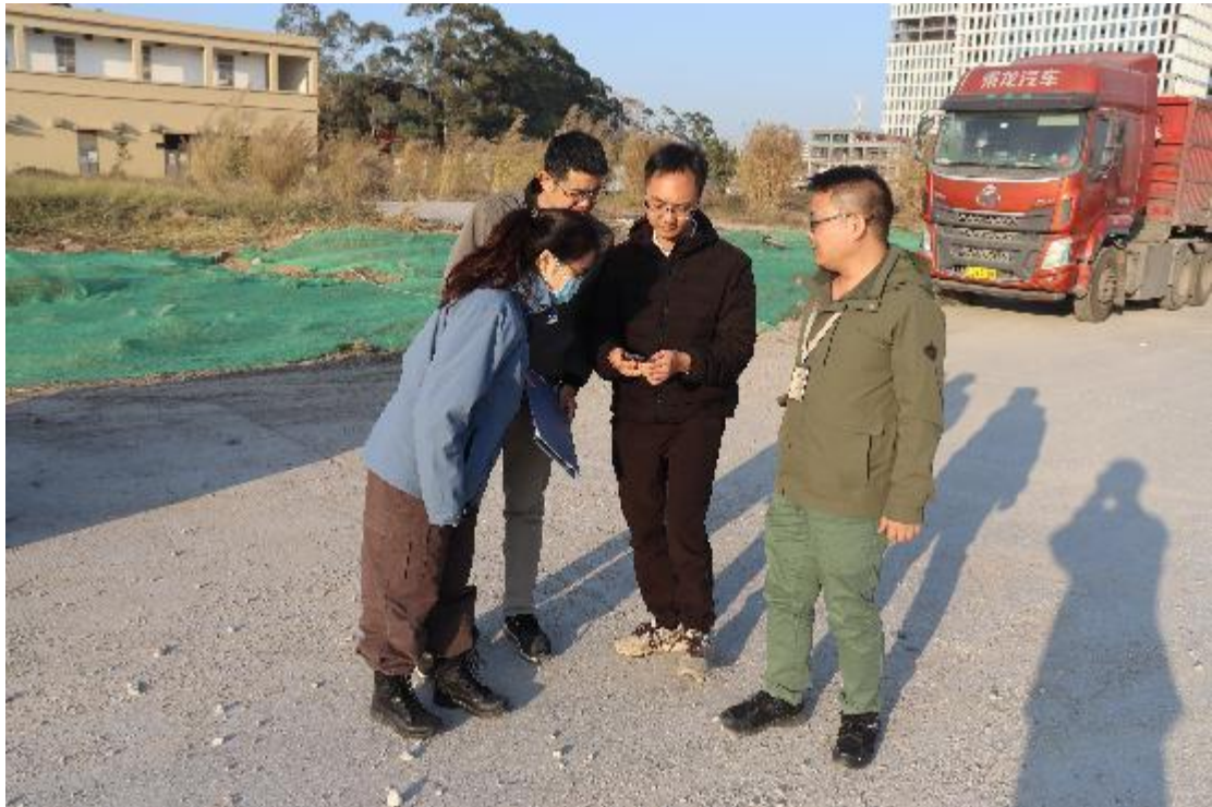
图 5 工作人员确认地块范围（西南-东北）