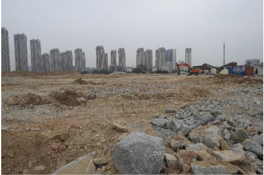
图 24 地块内横三路现状（西-东）