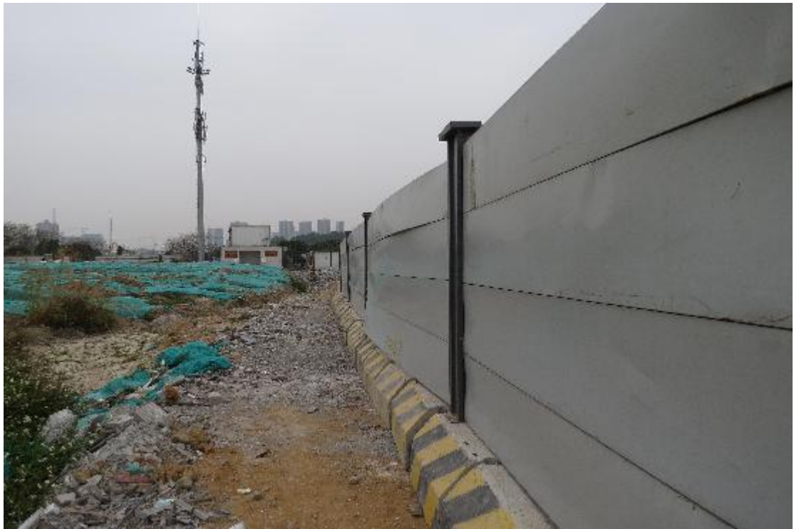
图 19 地块内横三路现状（东-西）