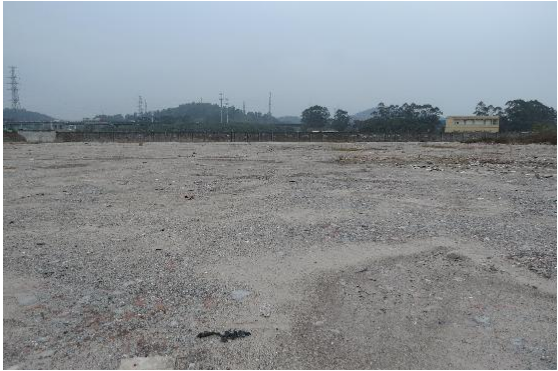
图 32 地块内纵二路现状（南-北）