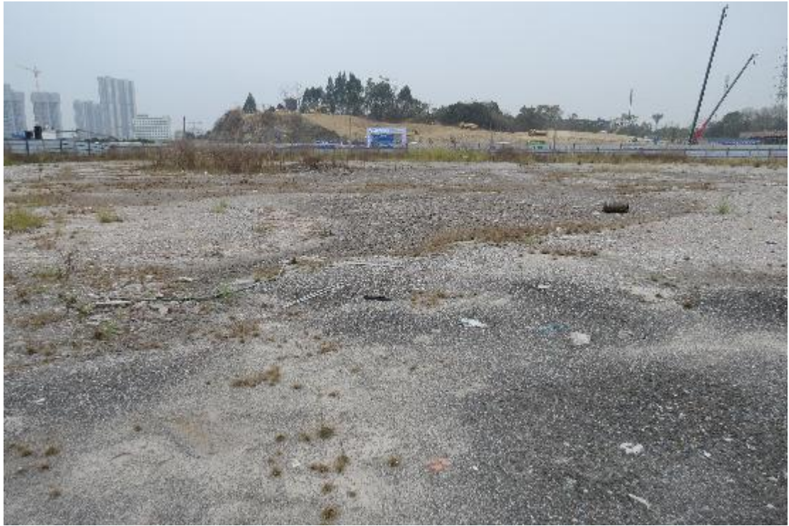
图 28 地块内纵二路现状（北-南）