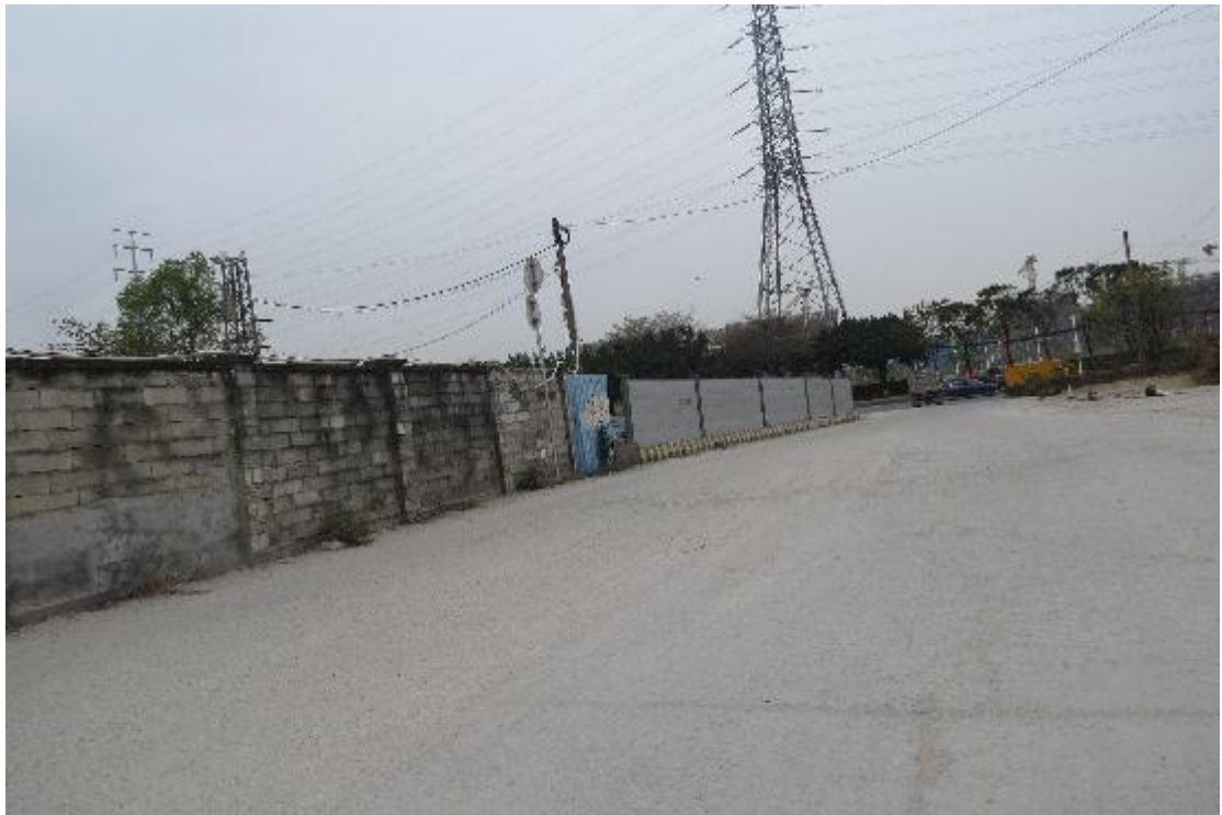
图 9 地块内横二路现状（东-西）