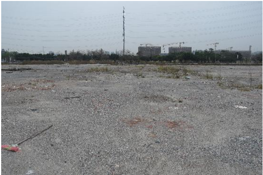
图 15 地块内横三路现状（东-西）