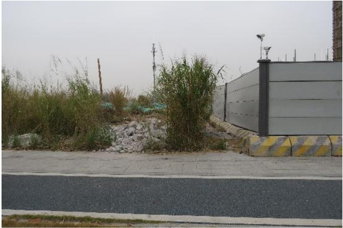
图 18 地块内横三路现状（东-西）