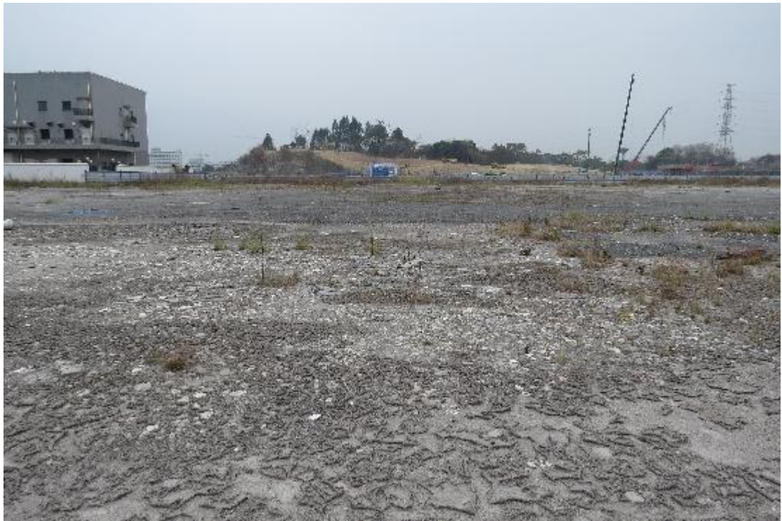
图 31 地块内横三路现状（北-南）