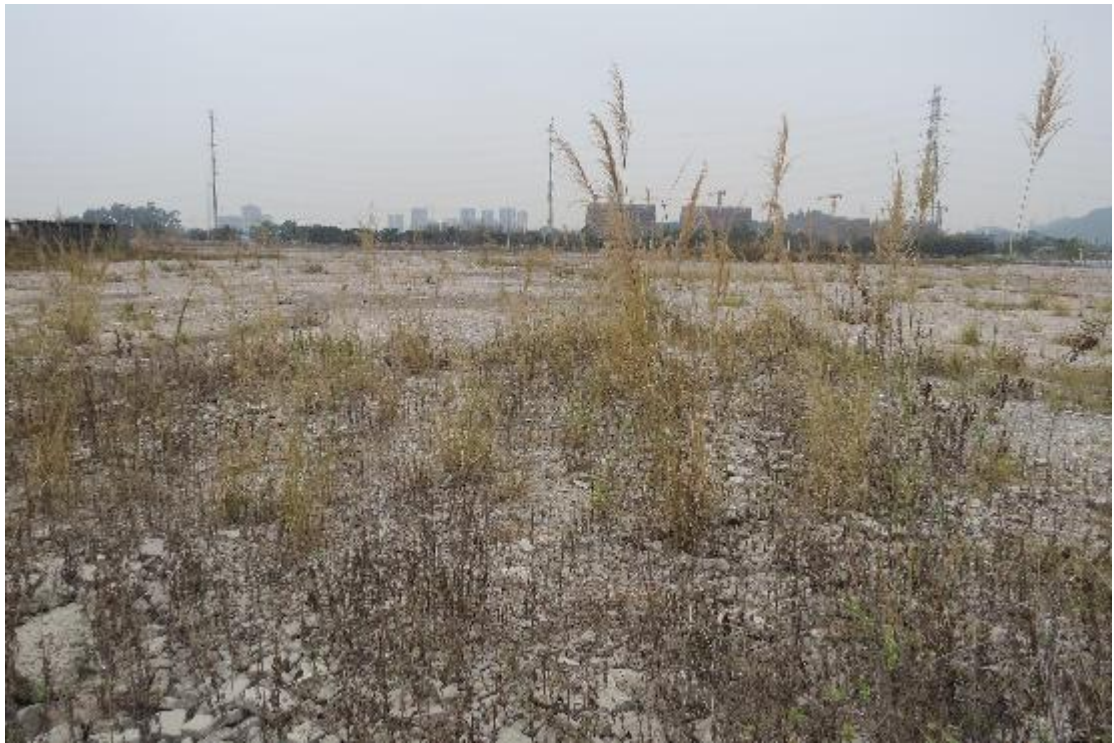
图 21 地块内横三路现状（东-西）