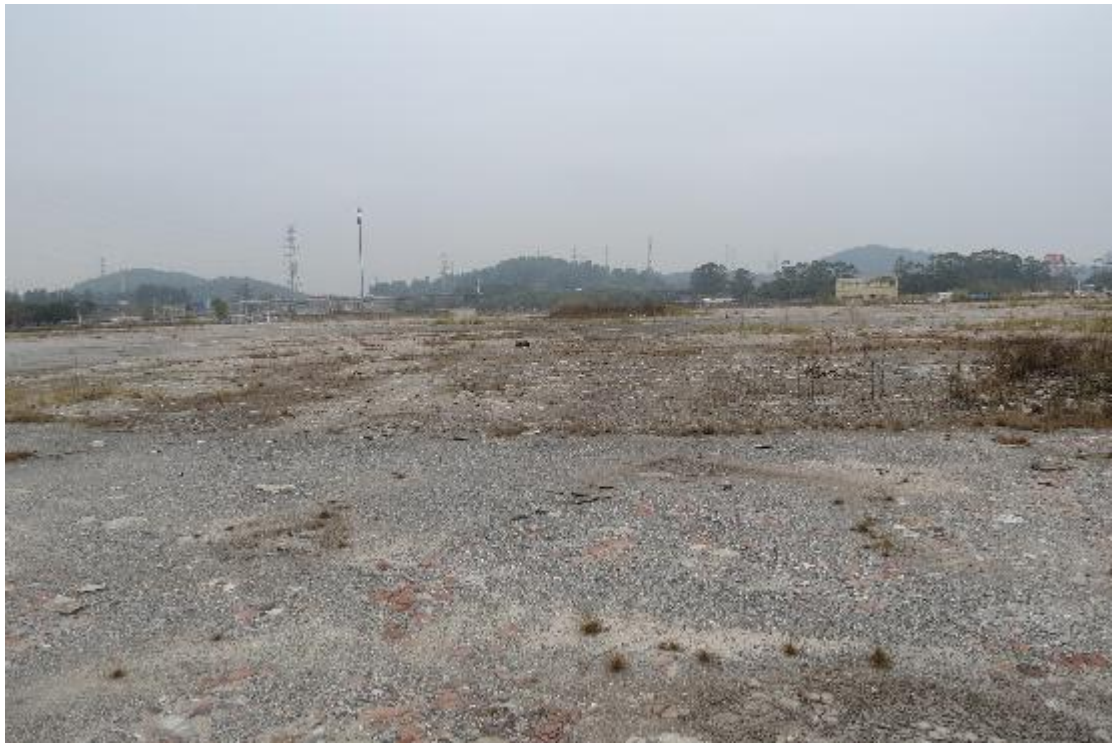
图 33 地块内横三路现状（南-北）