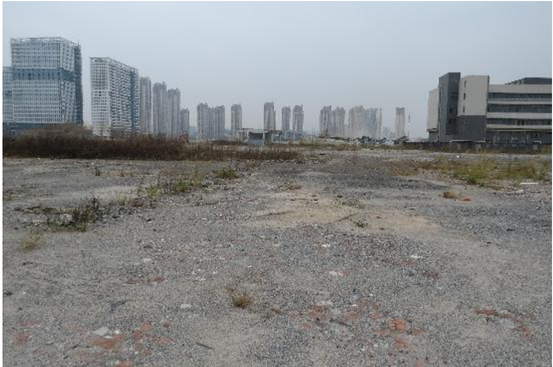
图 26 地块内横三路现状（西-东）