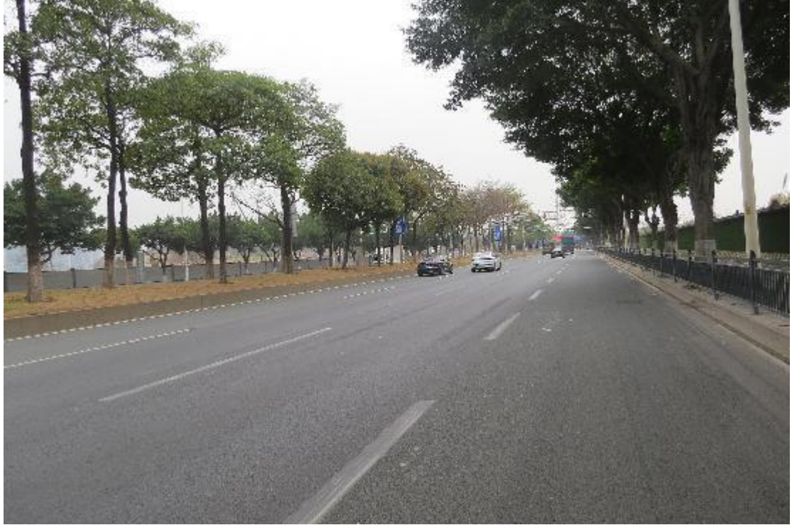
图 12 地块内横三路现状（北-南）