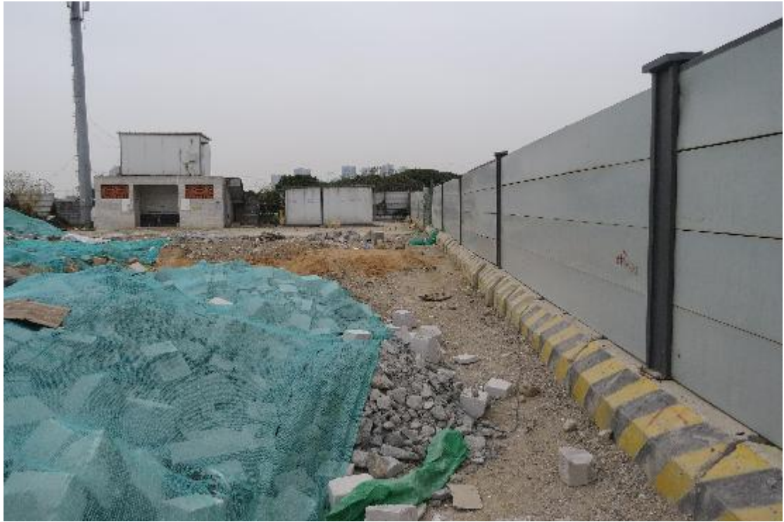
图 20 地块内横三路现状（东-西）