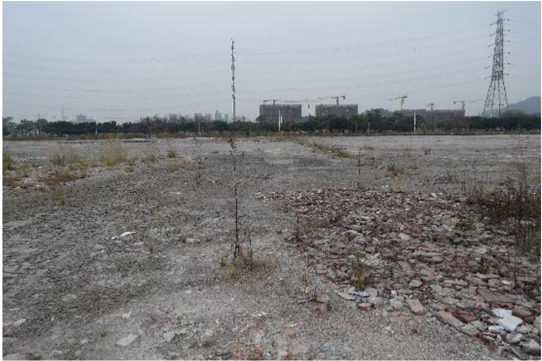
图 14 地块内横三路现状（东-西）