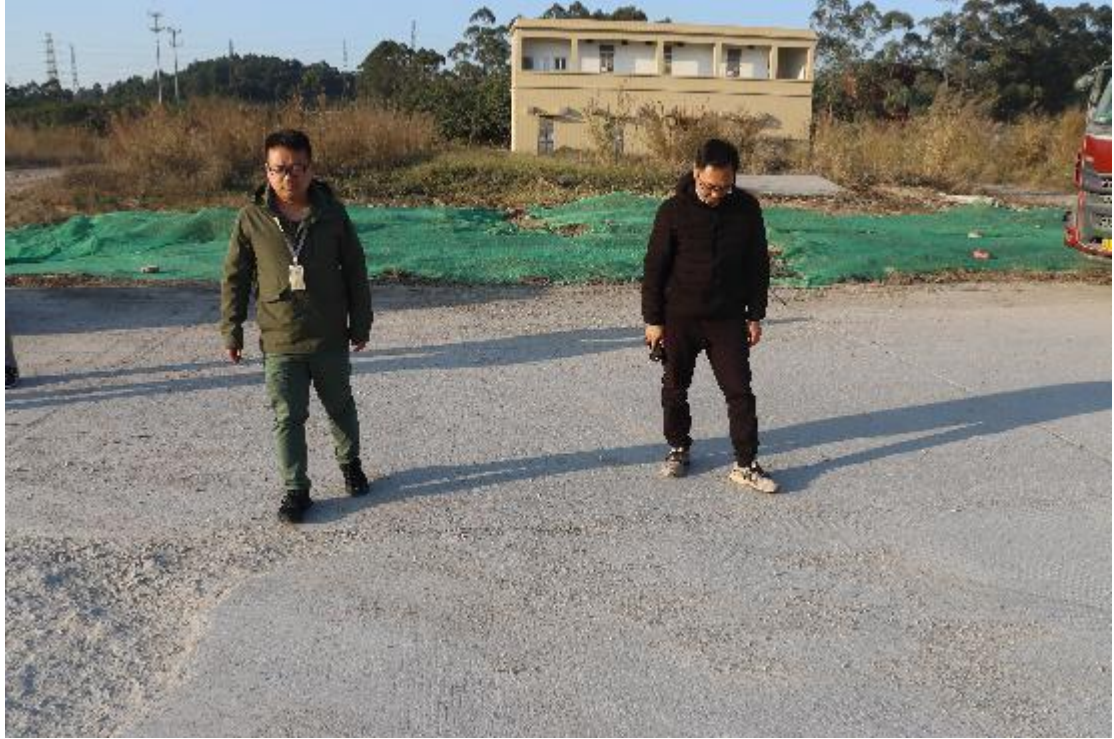
图 6 现场踏查（南-北）