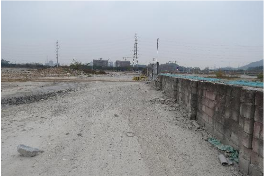
图 10 地块内横二路现状（东-西）