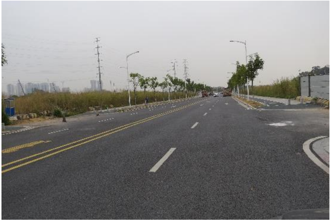
图 22 地块内横三路现状（南-北）