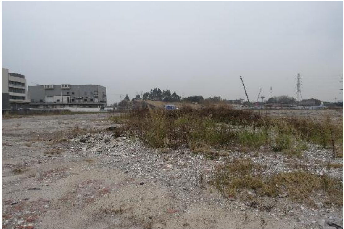
图 30 地块内纵二路现状（北-南）