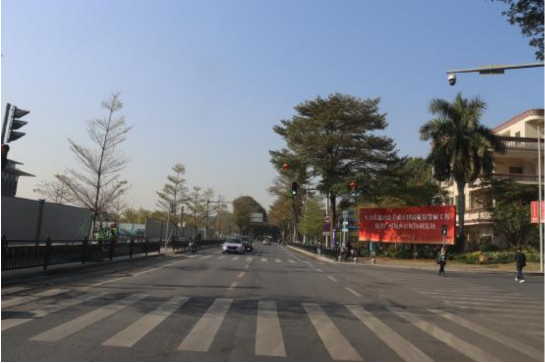
图 11 地块内现状（北-南）