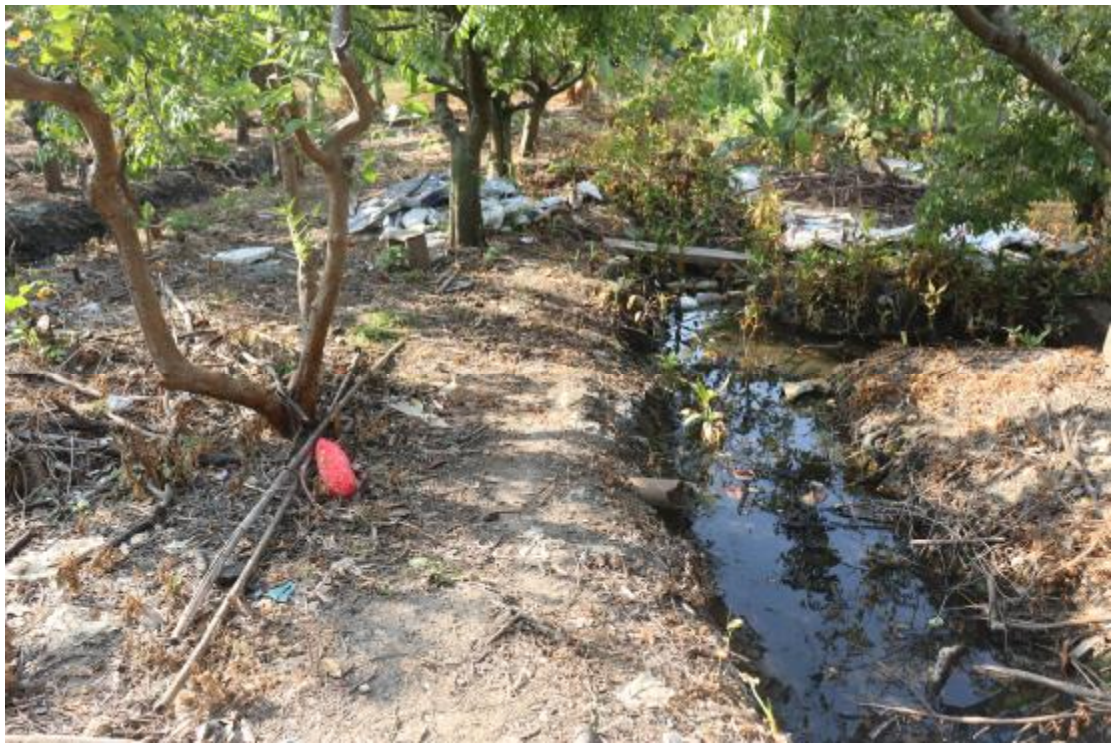
图 10 地块内现状（东北-西南）