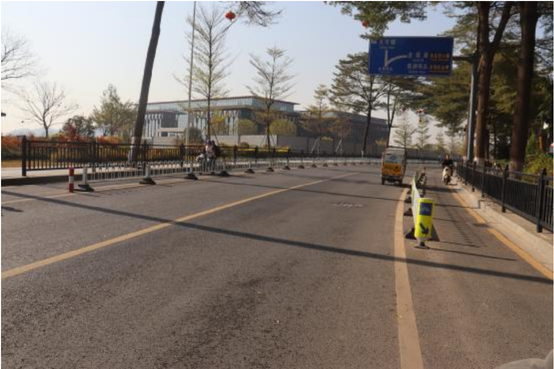
图 12 地块内现状（北-南）