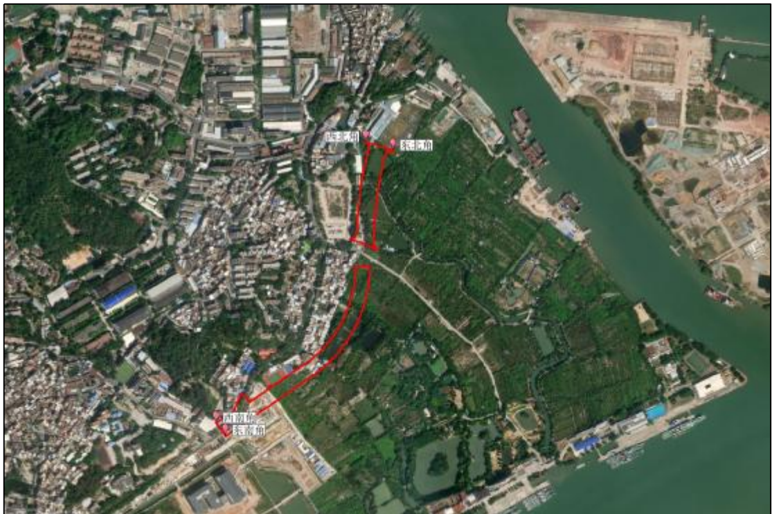
图 4 项目地块卫星红线图