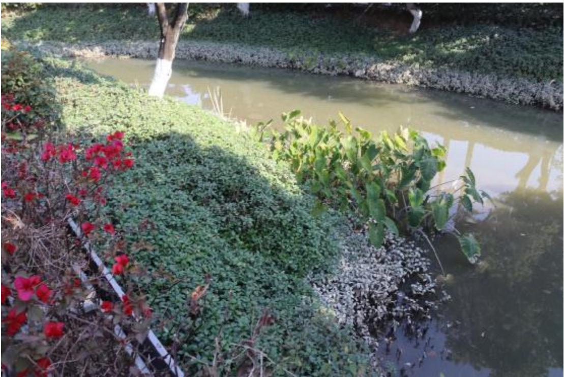
图 20 地块内现状（南-北）