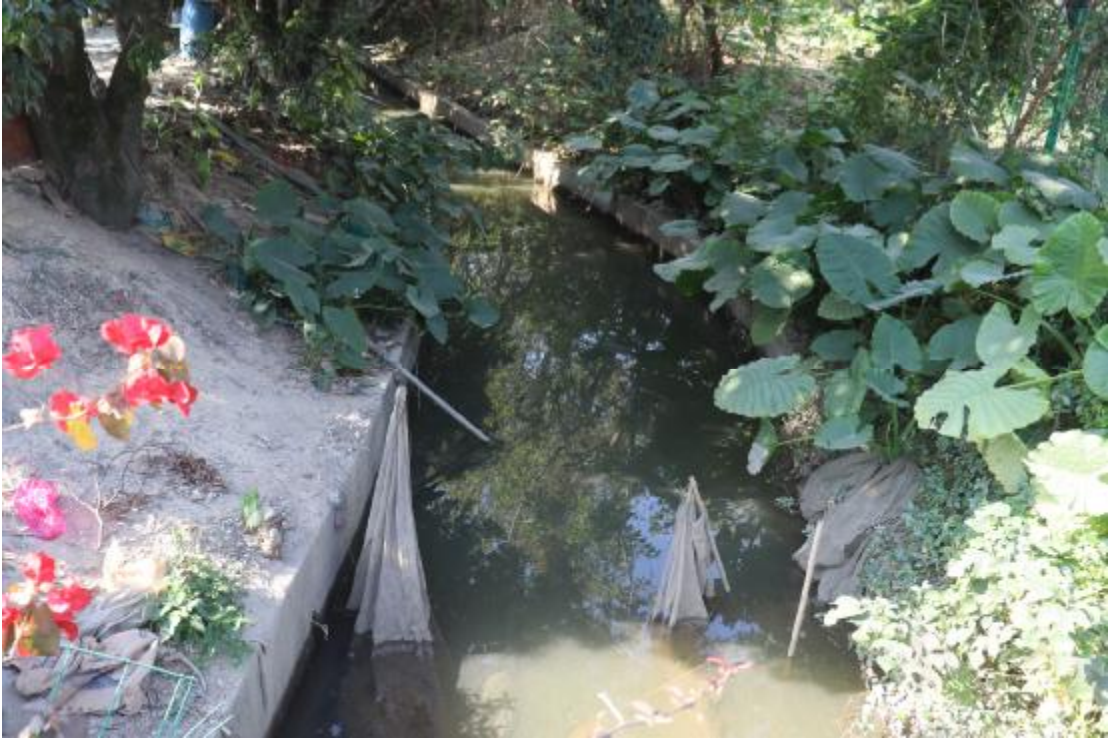
图 13 地块内现状（东北-西南）