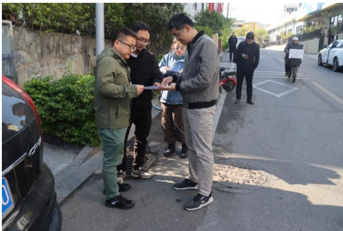
图 5 工作人员确认地块范围（东南-西北）