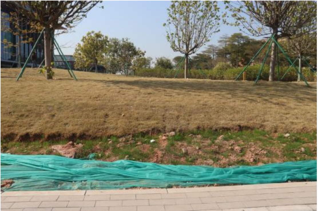
图 14 地块内现状（东北-西南）