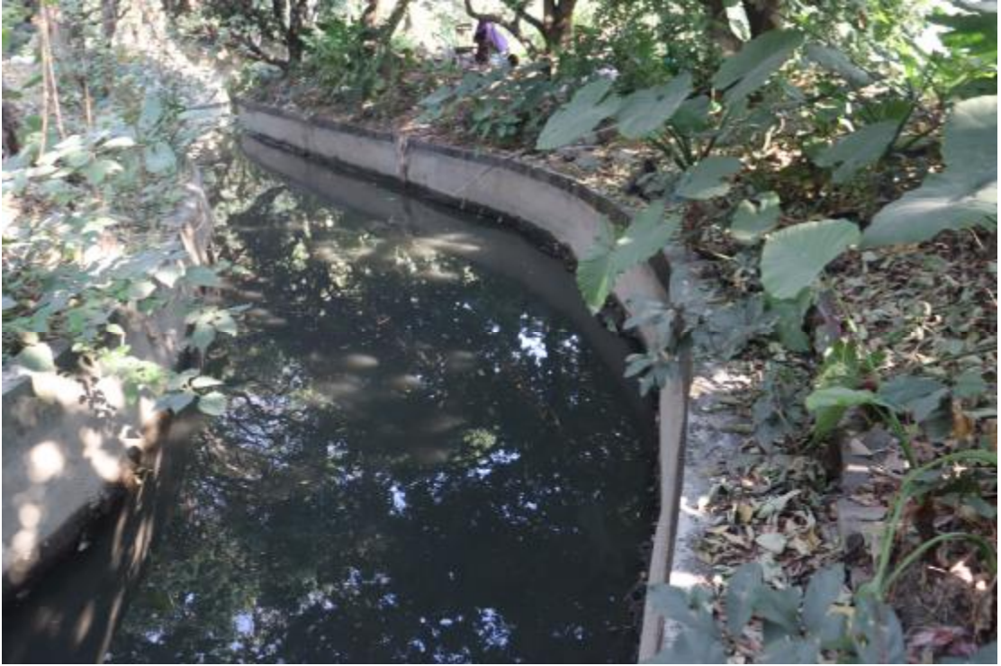
图 7 地块内现状（西南-东北）