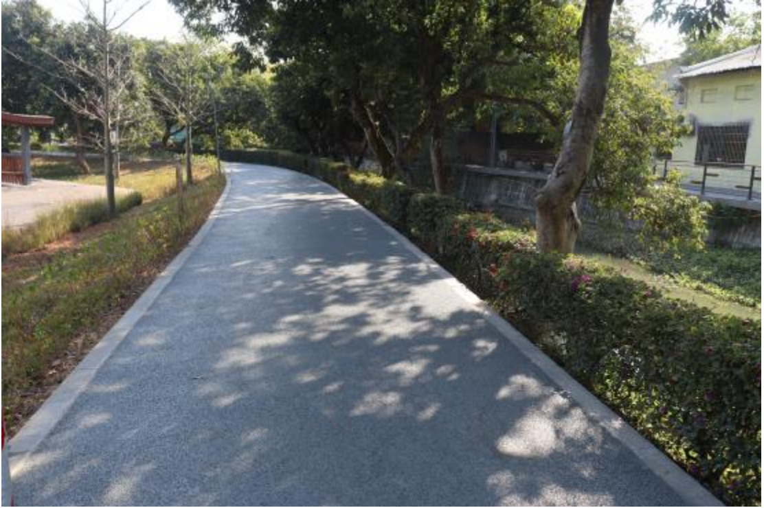
图 23 地块内现状（西-东）