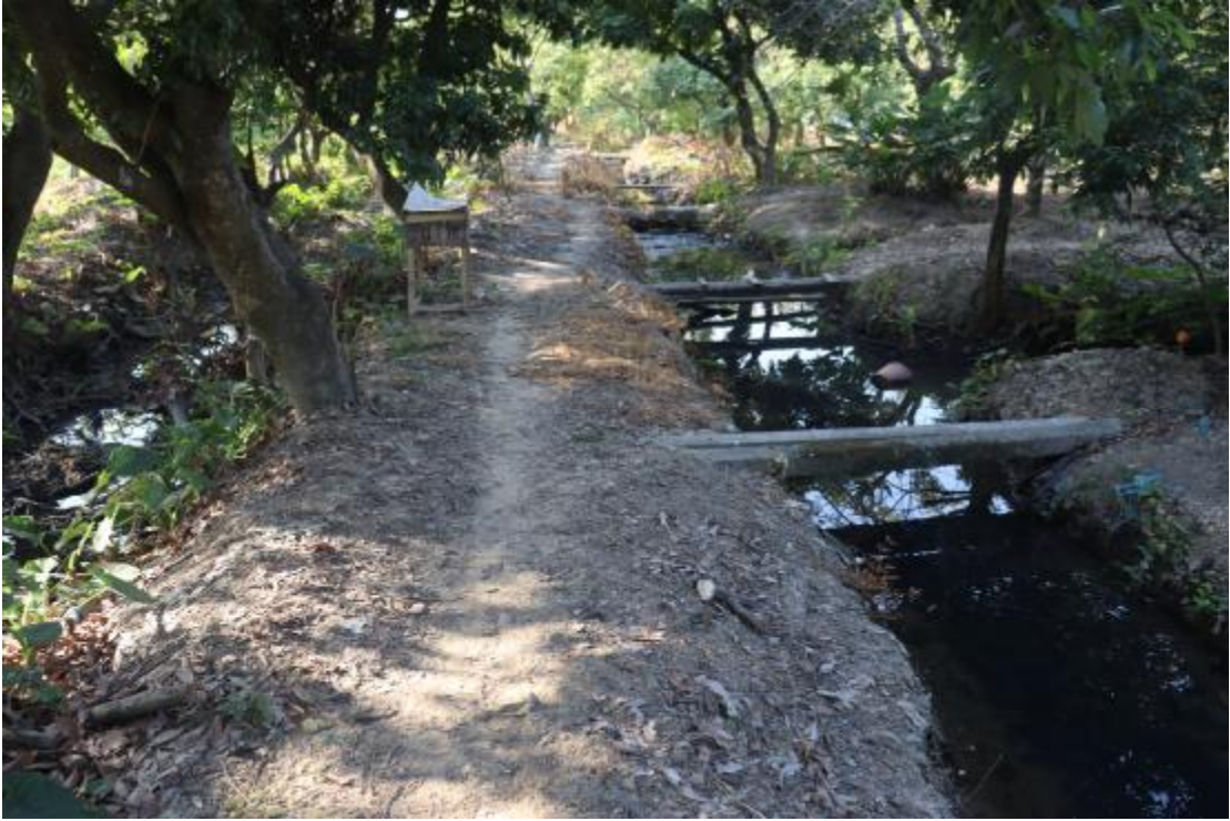
图 15 地块内现状（东北-西南）