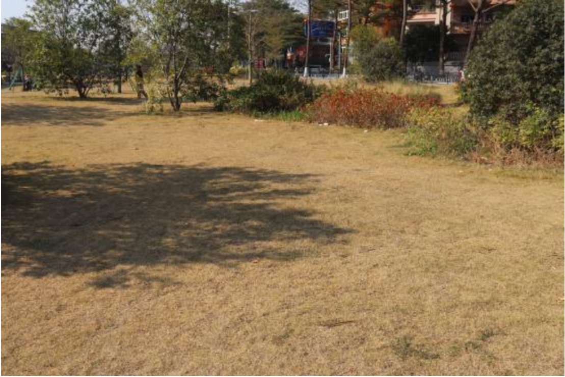
图 17 地块内现状（东-西）