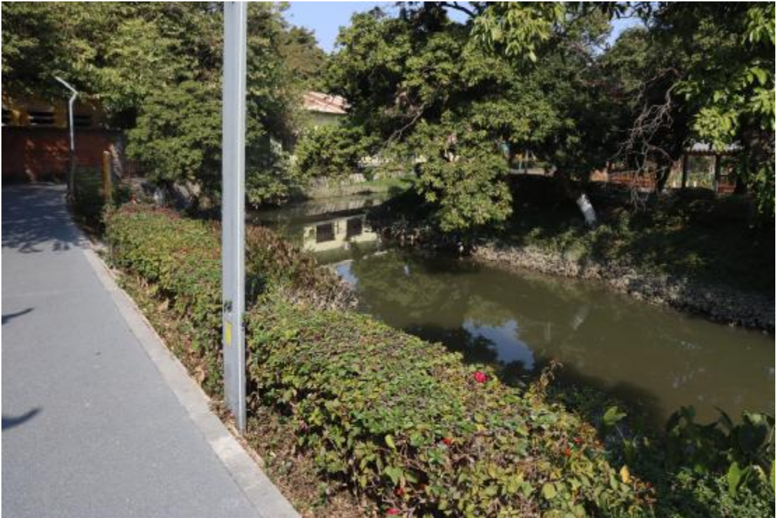
图 16 地块内现状（东南-西北）