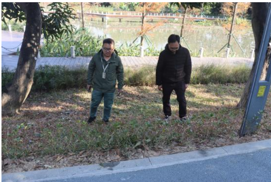
图 6 现场踏查（南-北）