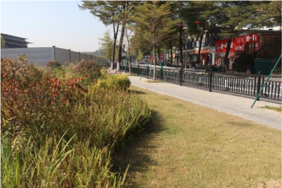
图 18 地块内现状（东-西）