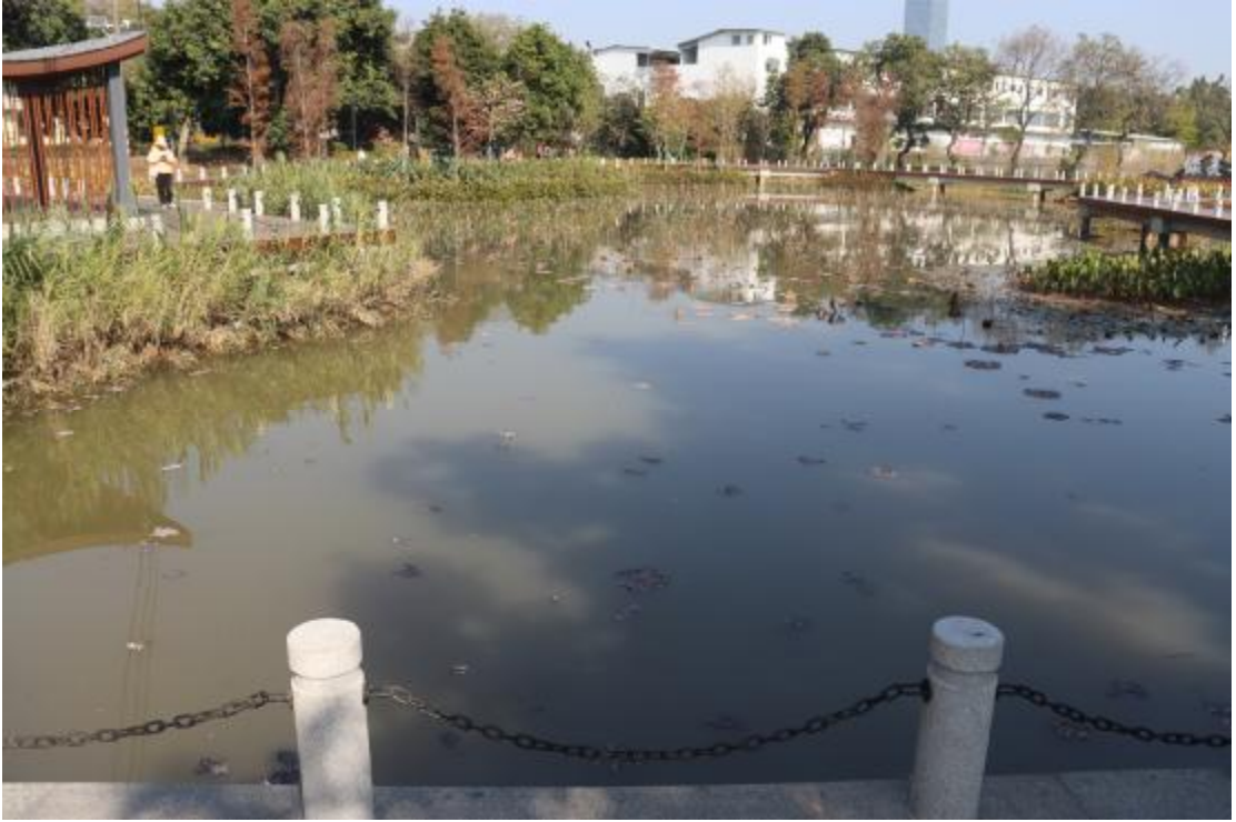
图 21 地块内现状（南-北）