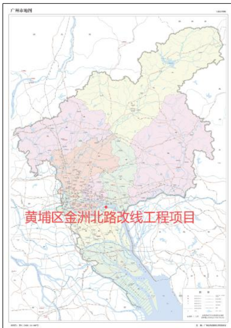
图 1 项目地块在广州市位置示意图（广州市规划和自然资源局）

根据《中华人民共和国文物保护法》《广州市文物保护规定》，按照《广州市文物局关于黄埔区金洲北路改线工程项目考古调查勘探工作的复函》（文物 20241502 号）指导意见，受广州开发区财政投资建设项目管理中心委托，由我院负责该项目的考古调查工作。