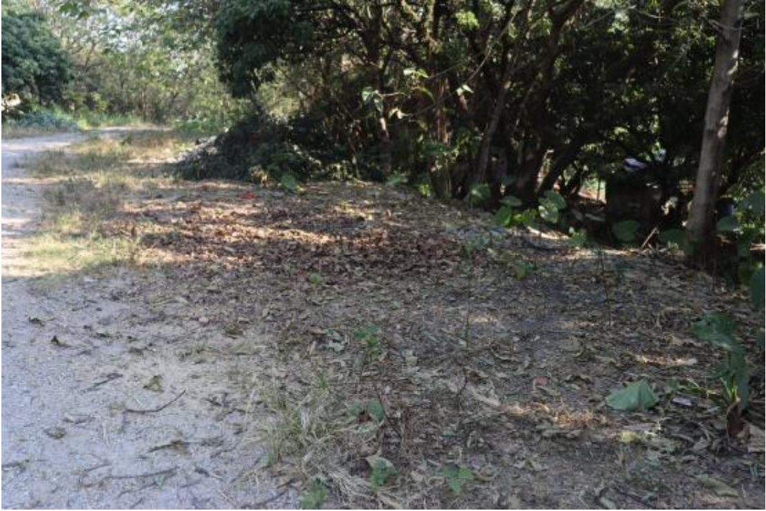
图 19 地块内现状（南-北）