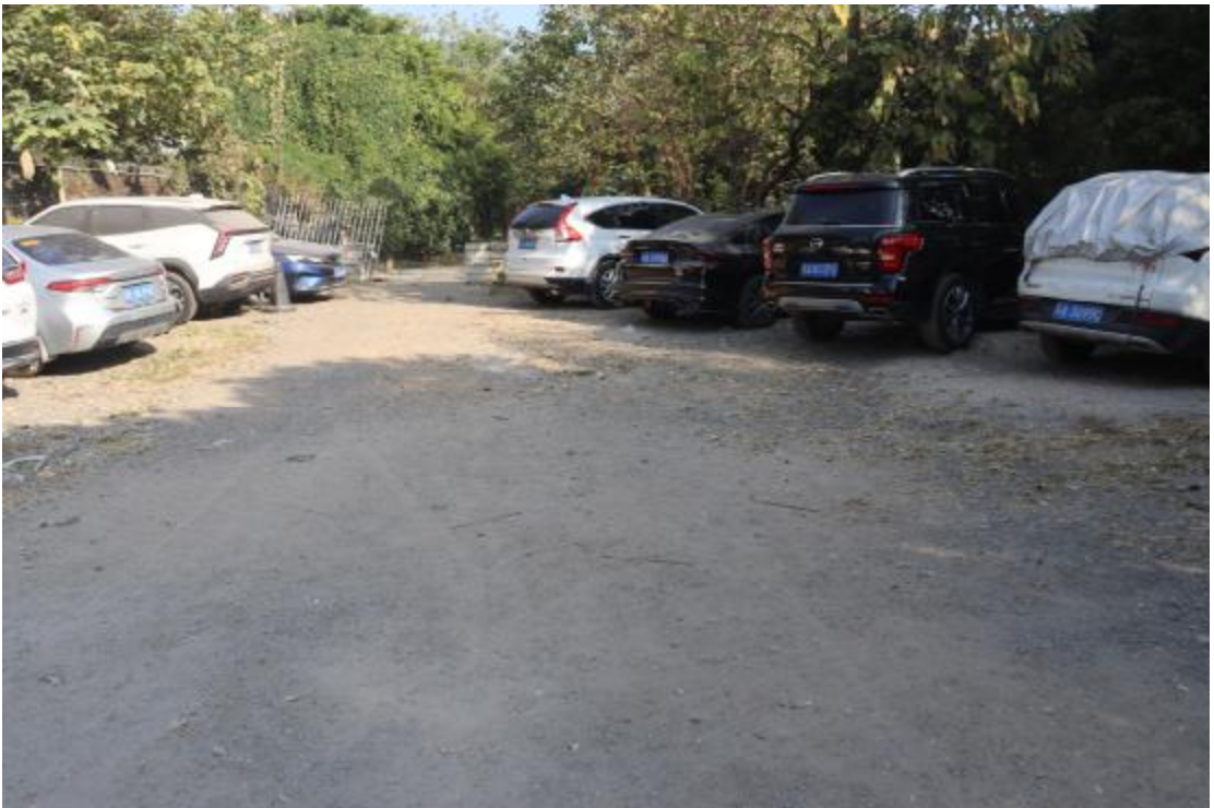
图 22 地块内现状（南-北）