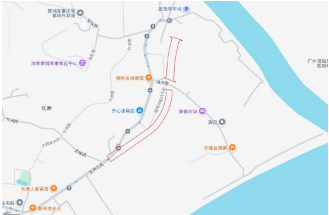
图 3 项目地块周边环境示意图（奥维地图）