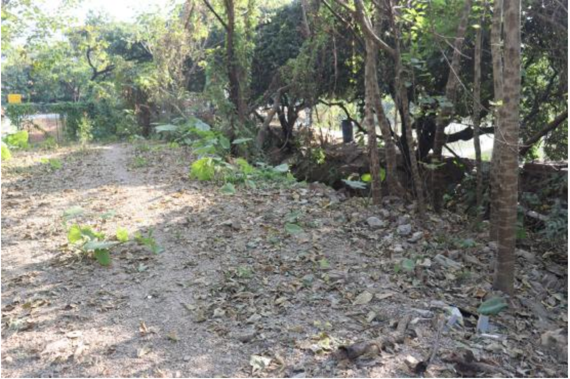
图 9 地块内现状（西-东）