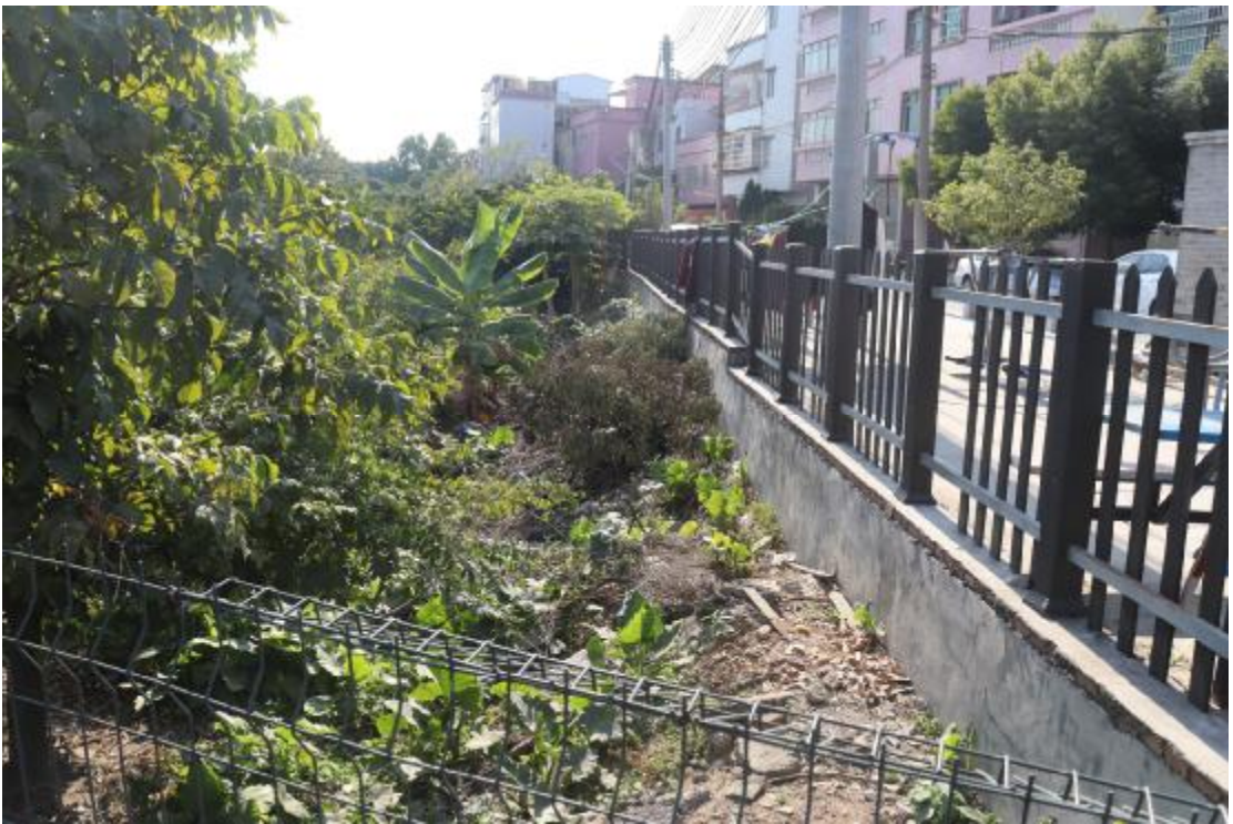
图 8 地块内现状（北-南）