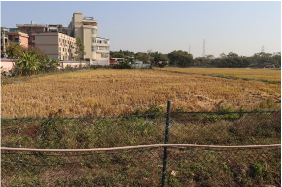
图 24 地块内现状（西南-东北）