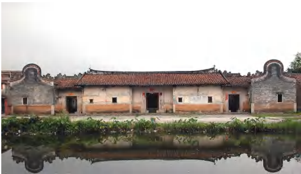
图 8 金鉴家塾

金鉴家塾 位于广东省广州市花都区狮岭镇新扬村一队 61 号。建于清光绪二十九年（1903 年）。坐北朝南。客家传统的双堂双横屋建筑。总面阔 34.2 米，总进深 20.6 米，建筑占地 704.5 平方米。正屋五间两进，俗称“五龙过脊”。下堂进深两间共二十一檩；上堂进深一间共二十檩，前带两廊，当地人称“塞笃廊”；正屋两旁各一个宽 3.4 米的水门，门楼十三檩；水门两侧各有一列横屋，面阔七间，进深一间。主体建筑为悬山顶，灰塑龙船脊，碌灰筒瓦，青砖墙，夯土墙基。现为花都区登记保护文物保护单位。