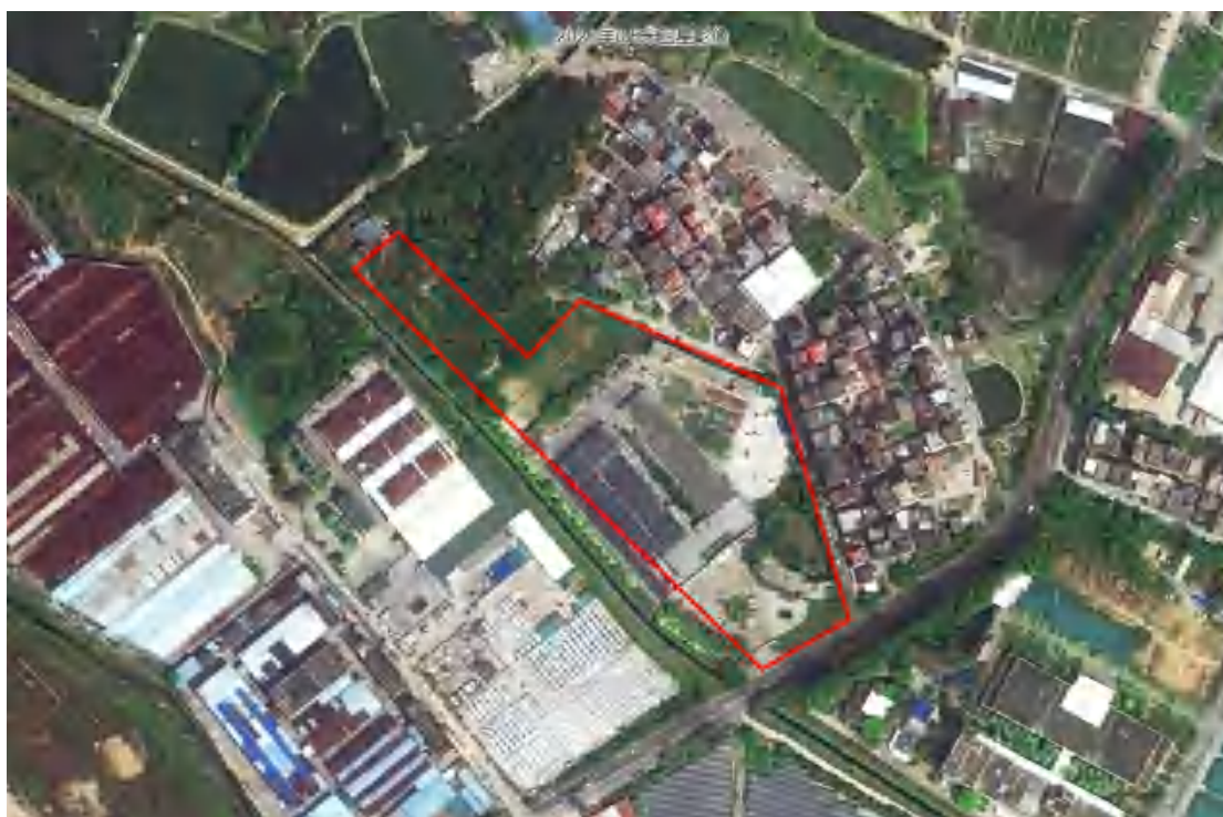
图 4 项目地块卫星红线图（甲方供图）