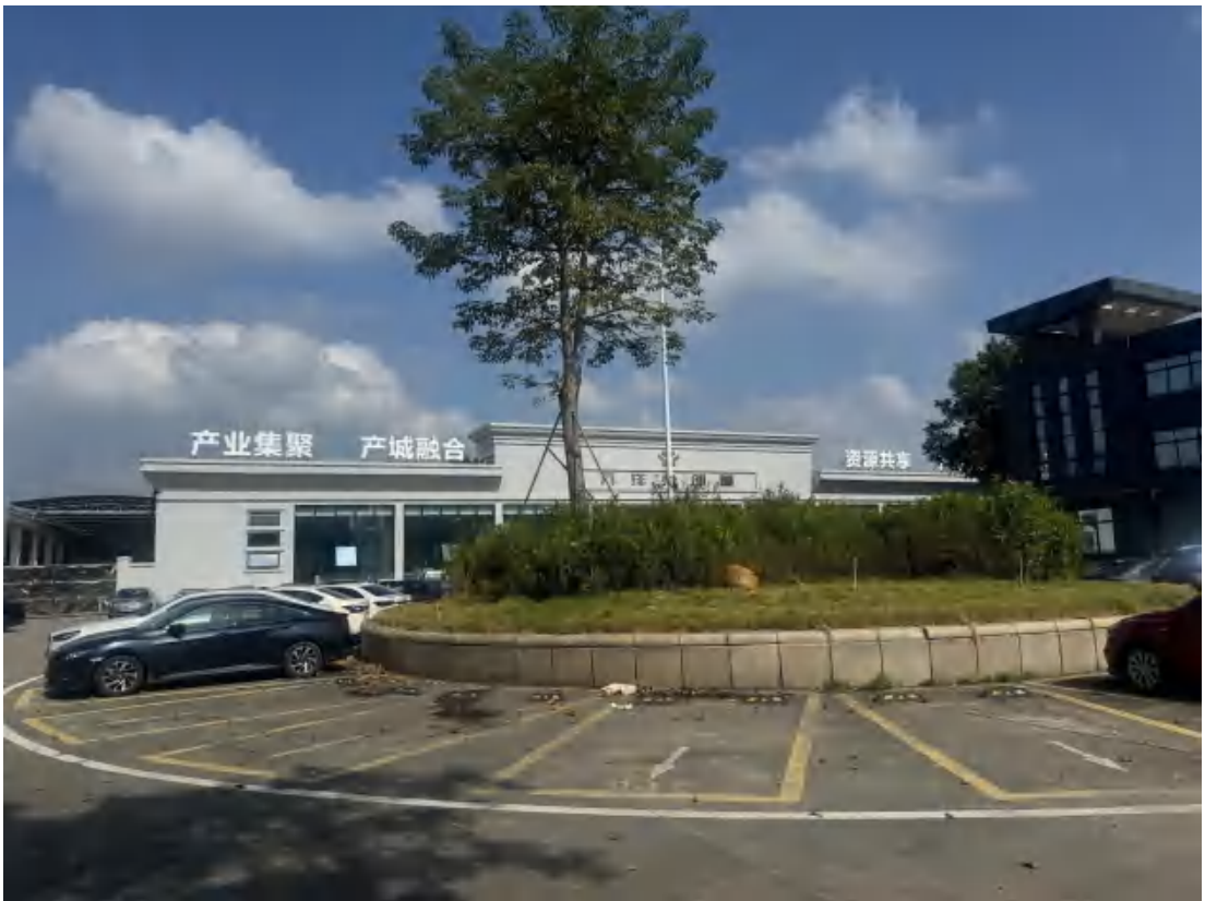
图 14 项目地块南部现状（南-北）