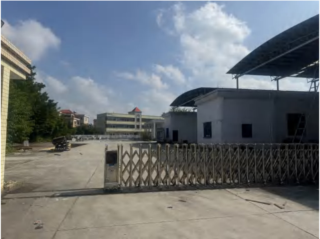
图 22 项目地块中北部现状（西-东）