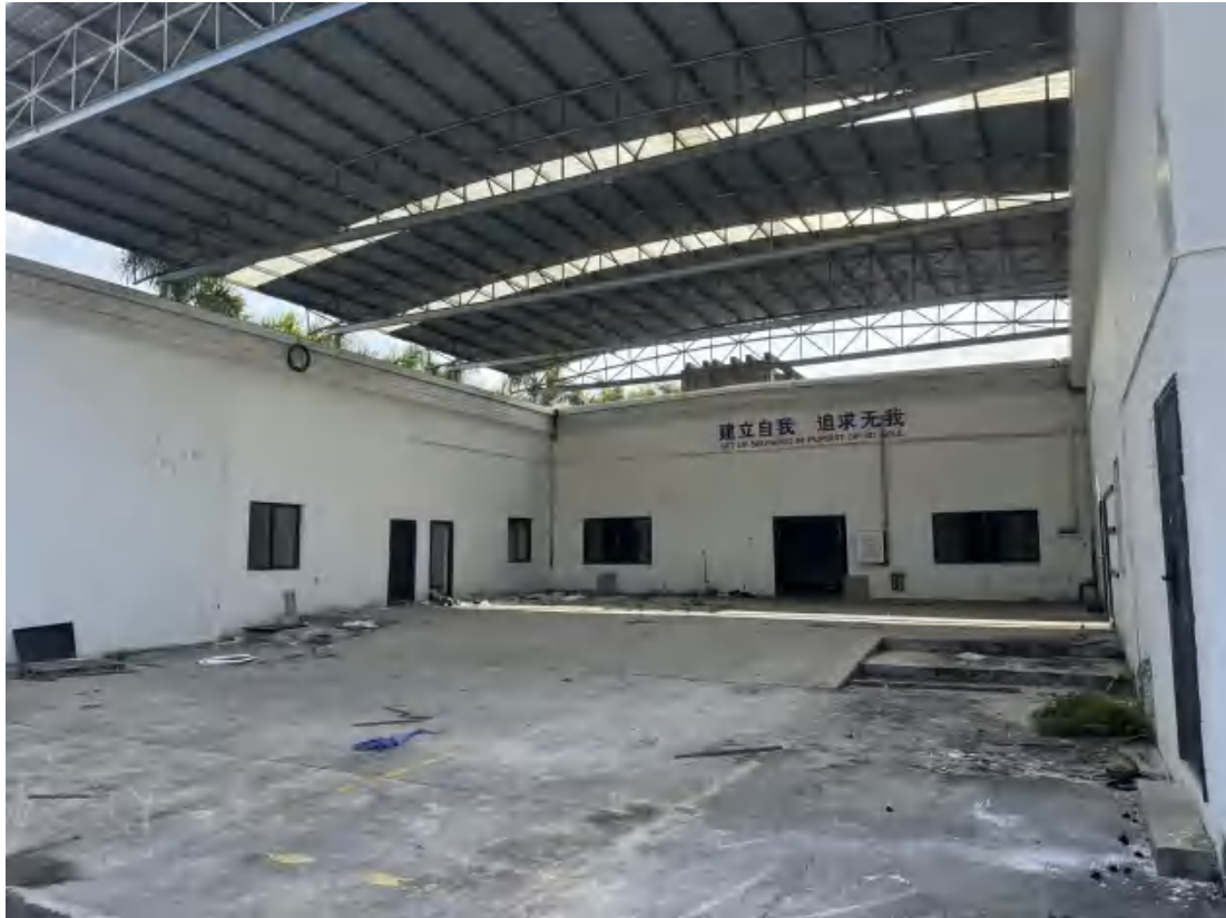
图 25 项目地块中东部现状（北-南）