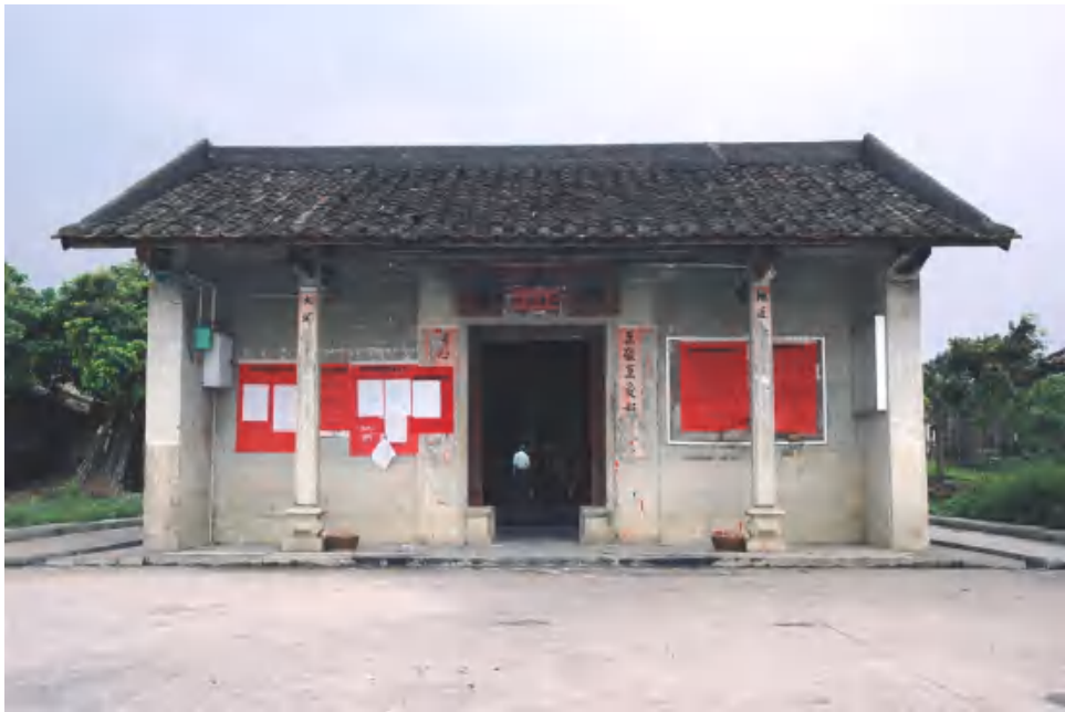
图 7 新民村大夫第正面

金鉴家塾 位于广东省广州市花都区狮岭镇新扬村一队 61 号。建于清光绪二十九年（1903 年）。坐北朝南。客家传统的双堂双横屋建筑。总面阔 34.2 米，总进深 20.6 米，建筑占地 704.5 平方米。正屋五间两进，俗称“五龙过脊”。下堂进深两间共二十一檩；上堂进深一间共二十檩，前带两廊，当地人称“塞笃廊”；正屋两旁各一个宽 3.4 米的水门，门楼十三檩；水门两侧各有一列横屋，面阔七间，进深一间。主体建筑为悬山顶，灰塑龙船脊，碌灰筒瓦，青砖墙，夯土墙基。现为花都区登记保护文物保护单位。