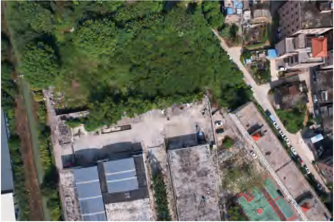
图 17 项目地块西部现状（东南-西北）