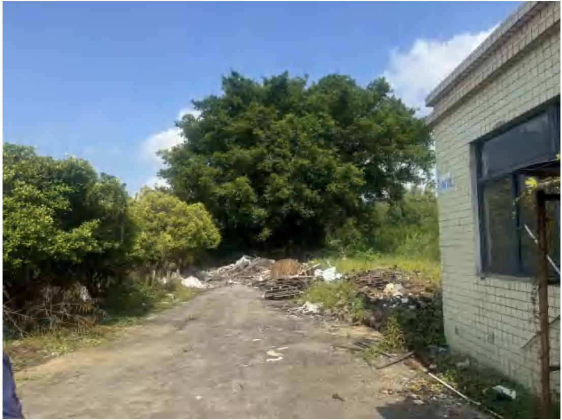
图 15 项目地块西北部现状（南-北）