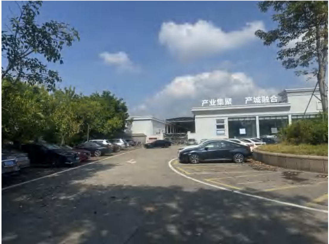
图 20 项目地块西南部现状（南-北）