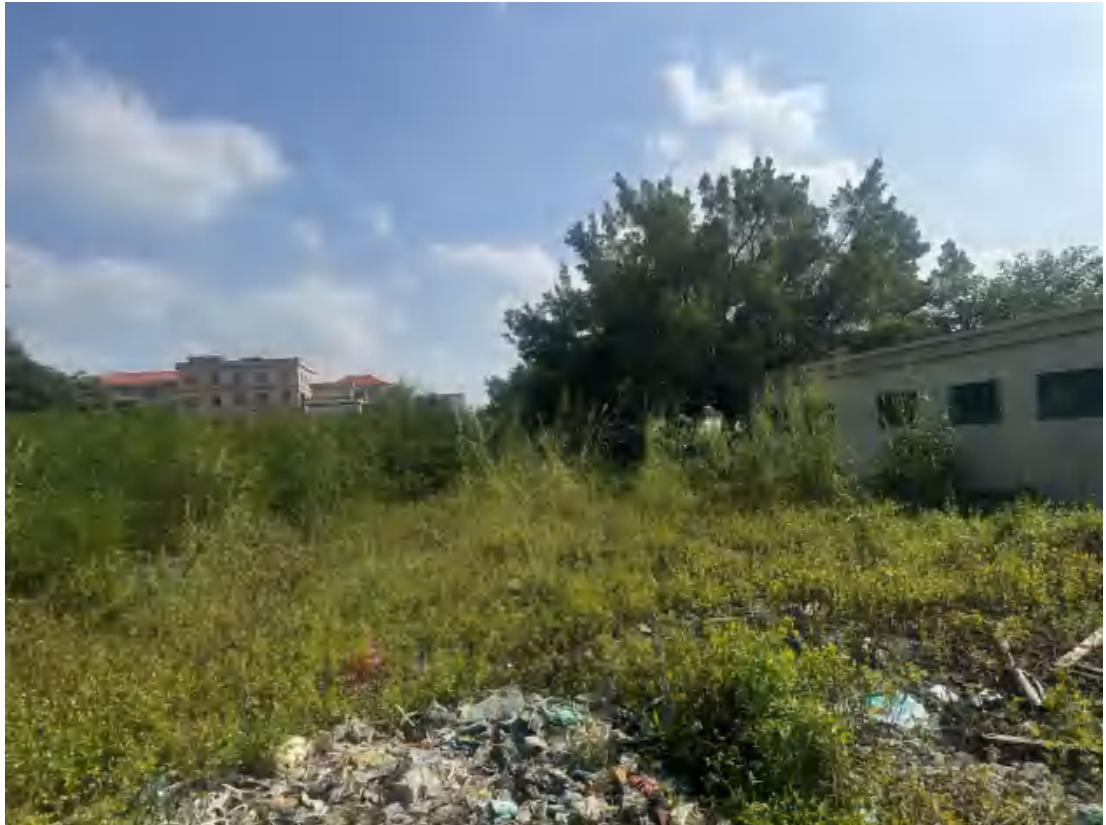
图 16 项目地块西北部现状（西北-东南）