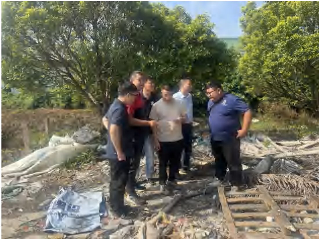
图 10 工作人员核对项目红线范围（东-西）