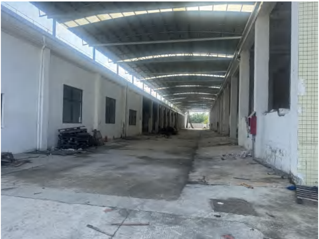
图 24 项目地块中部现状（北-南）