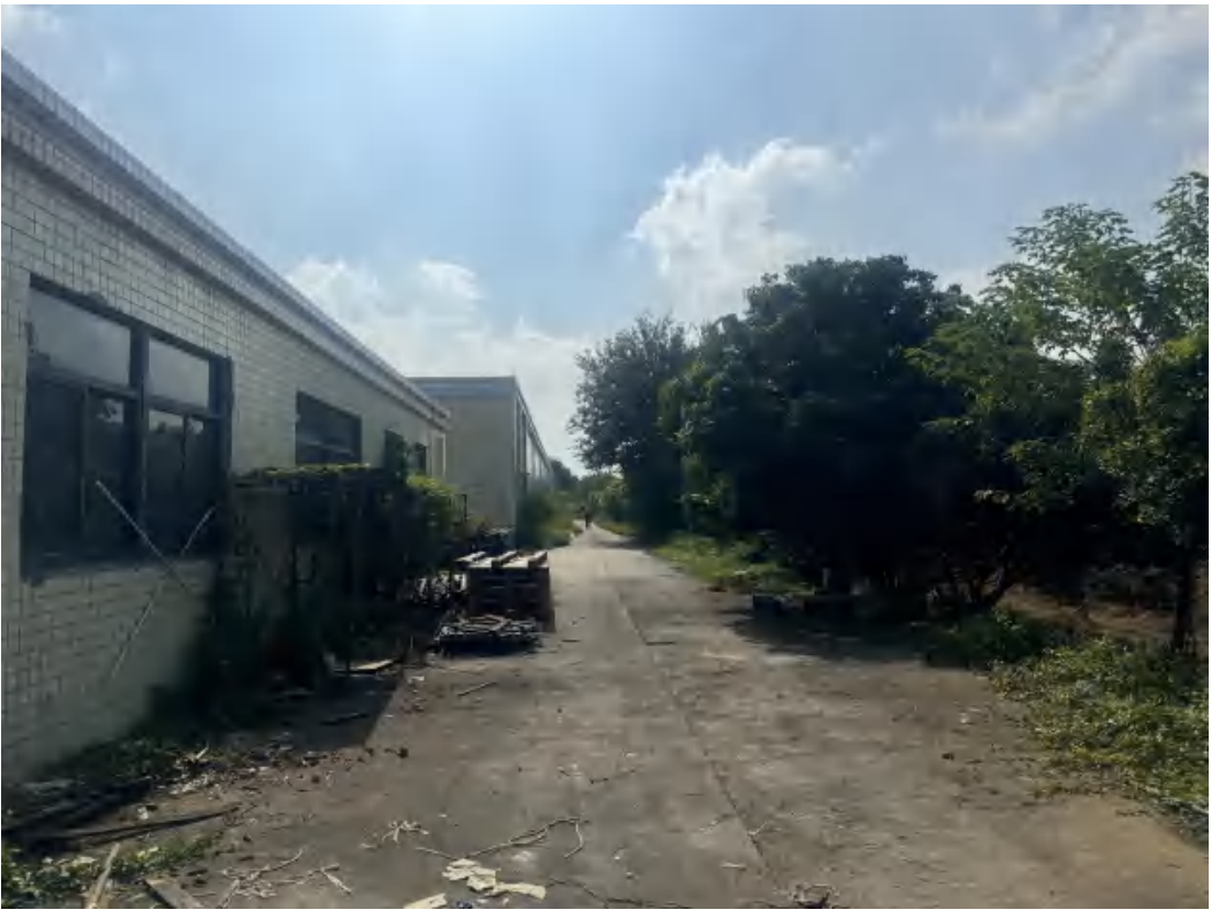
图 18 项目地块西部现状（西北-东南）