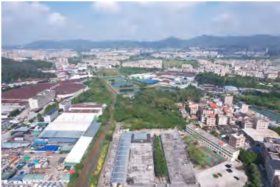
图 26 项目地块中西部现状（东南-西北）