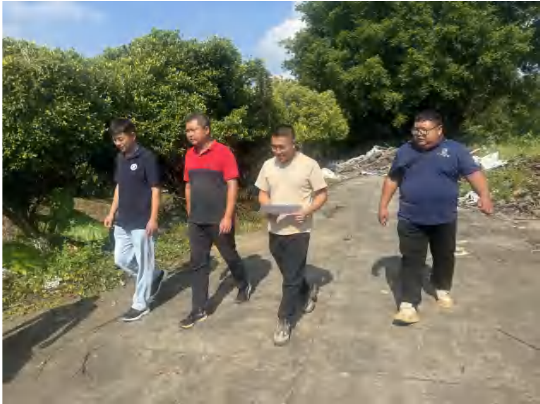
图 11 工作人员现场踏查（南-北）