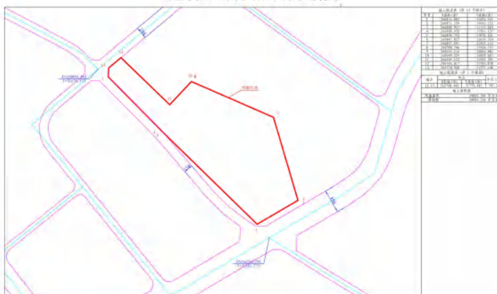
图 5 项目地块红线图