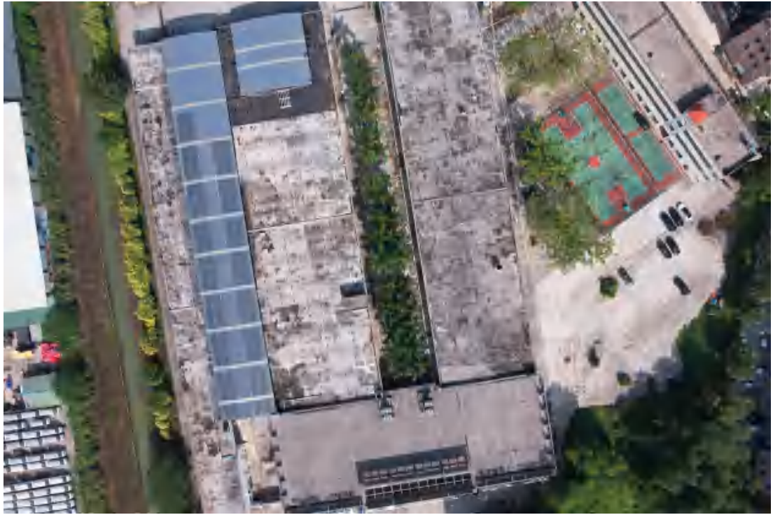
图 23 项目地块中部现状（东南-西北）