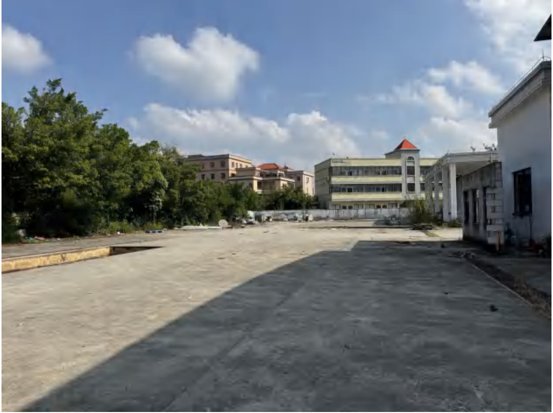
图 21 项目地块中北部现状（西-东）