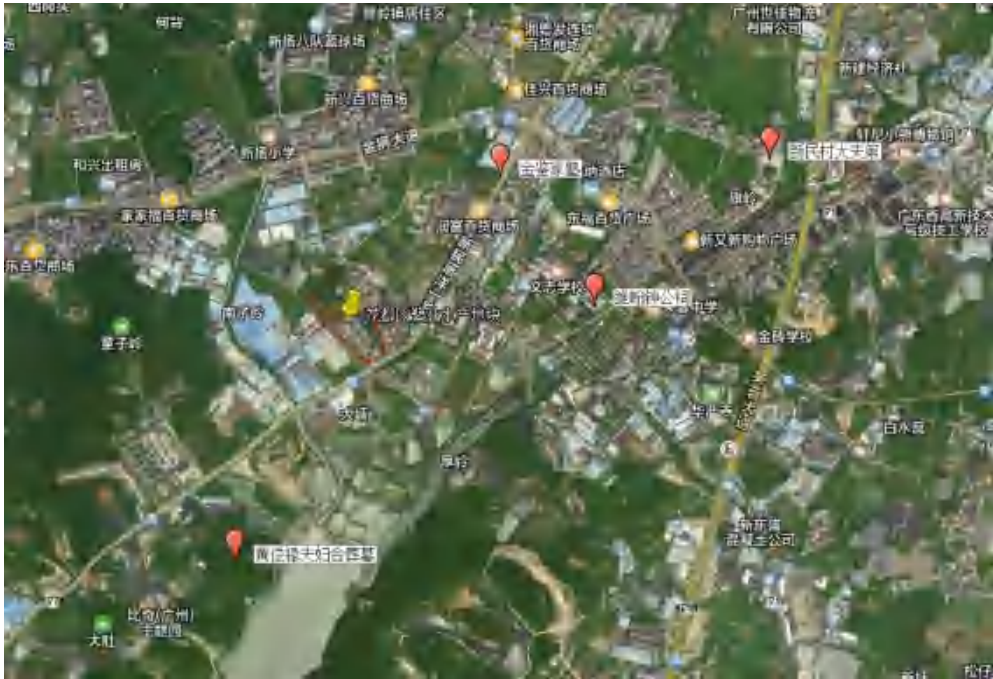
图 6 地块周边文物分布示意图

据资料记载，距离地块较近的文物资源主要有维翰钟公祠、新民村大夫第、金鉴家塾、黄俊禄夫妇合葬墓等，介绍如下：