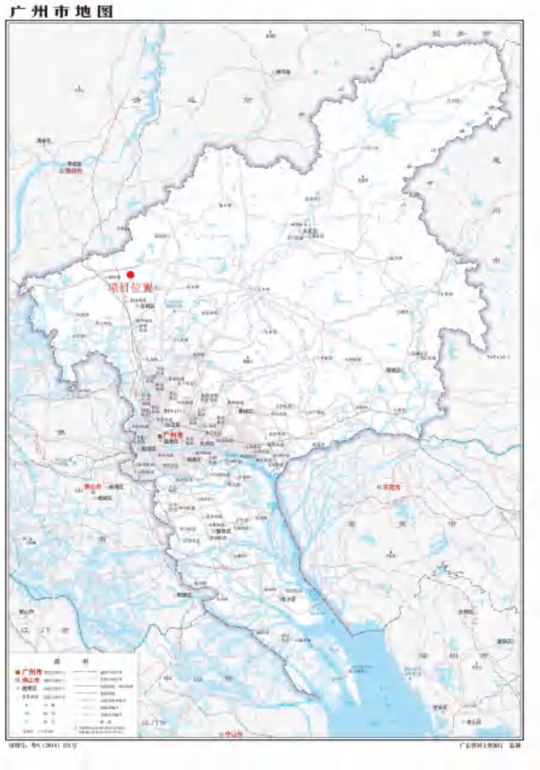
图 1 项目在广州市位置示意图（标准地图）

根据《中华人民共和国文物保护法》《广州市文物保护规定》，按照《广州市文物局关于花都区鹭业水产地块考古调查勘探工作的复函》（文物 20241171 号）的指导意见，受广州市花都区土地开发储备中心委托，由我院负责该项目的考古调查工作。