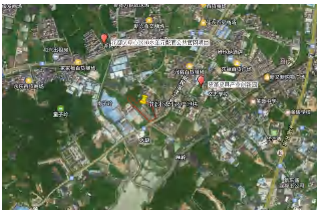
图9 地块周边历年考古工作情况

2022年9月-2023年1月，对皮革皮具产业创新园进行了考古调查区域评估工作，未发现古代文化遗存。