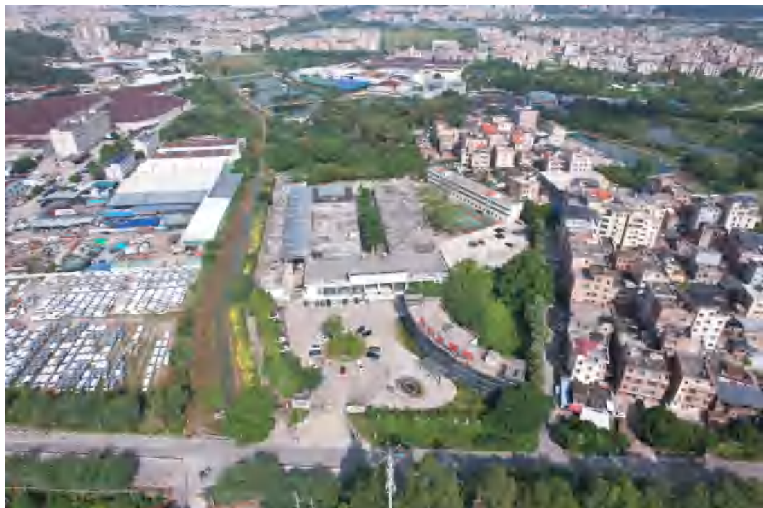
图 12 项目地块整体航拍（东南-西北）