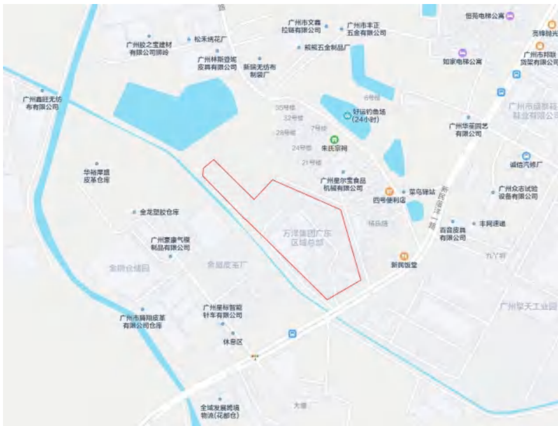
图 3 项目地块周边环境示意图