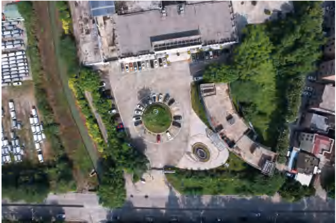
图 13 项目地块东部现状（东南-西北）