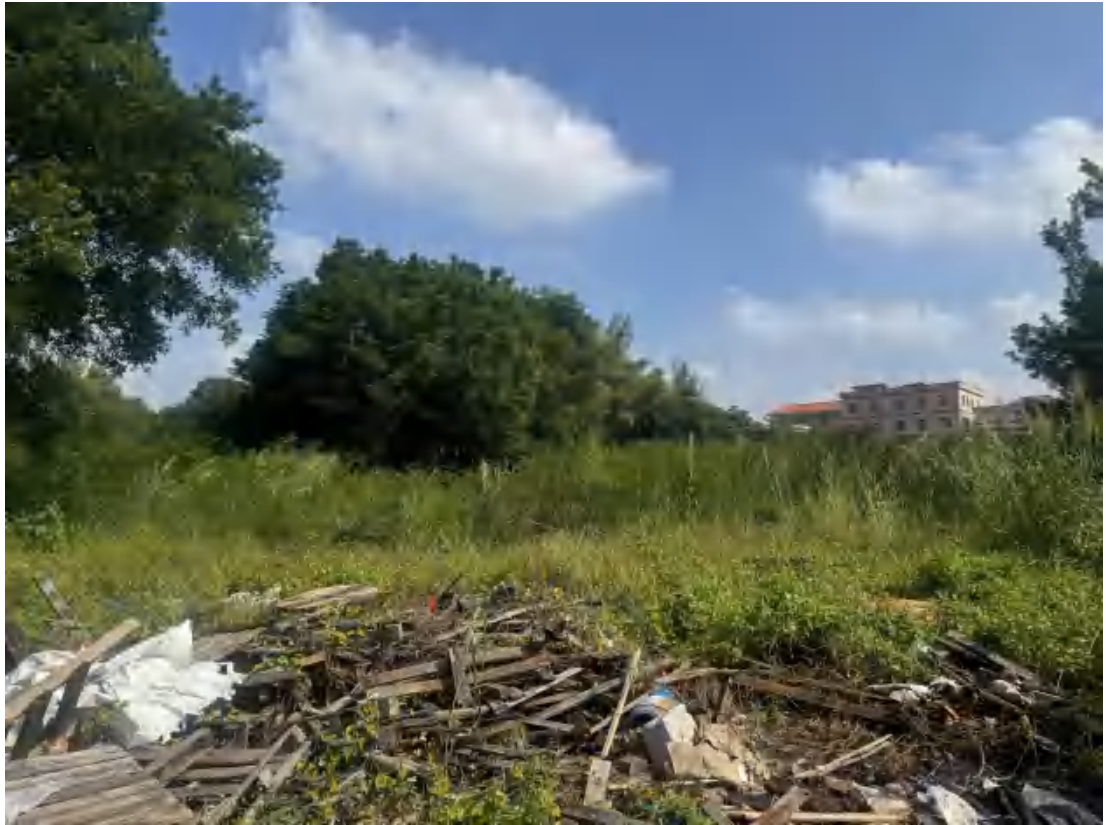
图 19 项目地块北部现状（西南-东北）