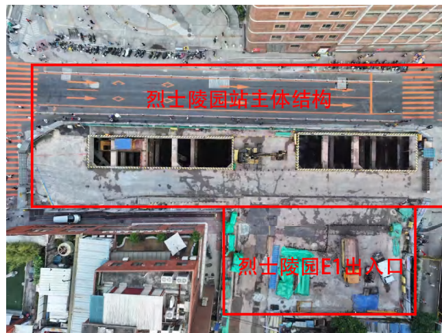
图 13 烈士陵园站 E1 出入口与主体结构相对位置示意图（俯视上为东）

2023年3月-2024年6月，对第十五届全运会广东省人民体育场改造项目进行了考古调查勘探工作，未发现古代文化遗存及不可移动文物。