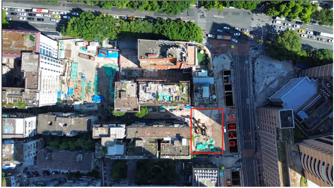
图 17 E1 出入口位置示意（俯视上为北）