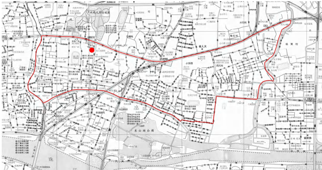
图 6 项目在“东川路-龟岗-达道路”地下文物埋藏区位置（红点为项目位置）

“东川路-龟岗-达道路”地下文物埋藏区位于广州历史城区东面，南临珠江，区域内有龟岗、姚家岗等低矮山岗。这一区域的地下文物遗存以墓葬为主，另有一些水井、灰坑等。墓葬以龟岗、姚家岗、寺贝通津、达道路一带最为集中。这一区域西部可能埋藏有明清时期建筑遗存。