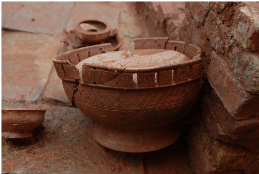
图 11 达道路工地出土东汉陶簋

中山大学天文台旧址 位于越秀中路125号广东省电影公司院内。建于1929年3月。天文台依山而建，高3层，红砖墙，外墙涂黄色涂料，砖混结构建筑。主体建筑有一层地下室。一楼中部有台阶通往大门，前出一个以两条仿爱奥尼式柱支撑的门廊；二楼中部有出挑的阳台，阳台上设拱券式门通往屋内，屋顶有三角形山花。主体建筑东侧建有折式楼梯可上高3层、平面八角形的天文观测工作室。现在三层的楼梯原来圆形的房顶已经改建成平顶，并加建了楼层。