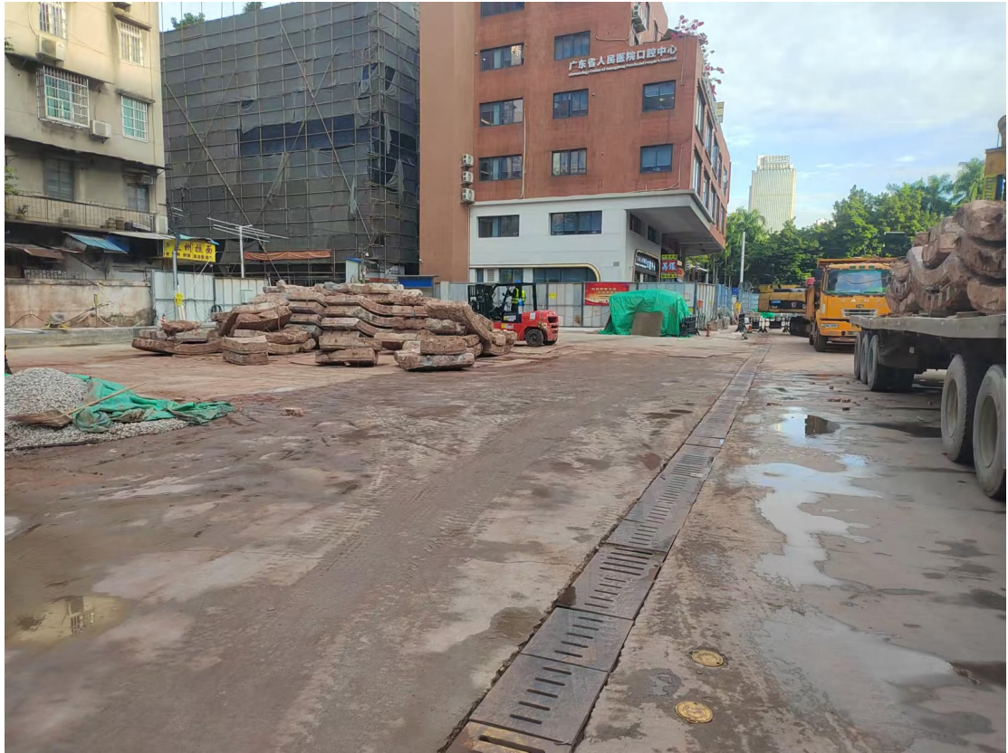
图 21 地块东南部现状（东南-西北）