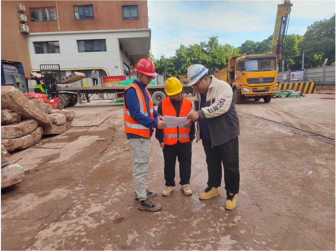
图 15 核对地块范围（南-北）