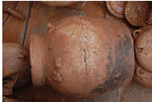
图 12 达道路工地出土东汉陶罐

历年考古工作情况表明，在地块500-1000米范围内，仅中山大学北校区发现少量古代文化遗存，其余区域均未发现古代文化遗存及不可移动文物。1000米以外区域有少量古代文化遗存发现并进行了抢救性考古发掘工作。