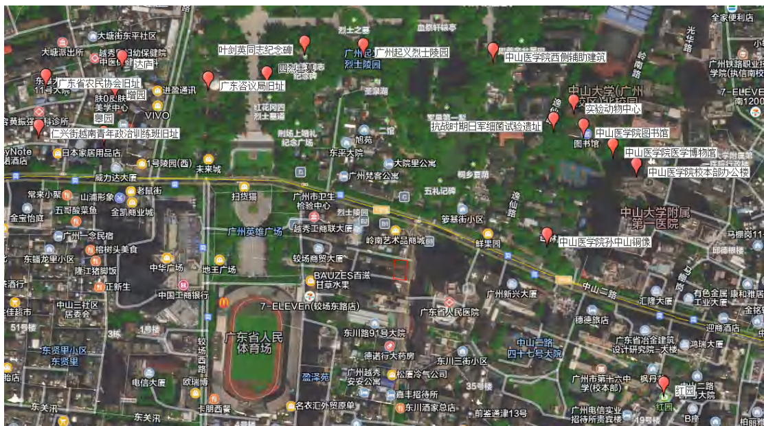
图 7 地块周边文物资源分布示意图（腾讯卫星地图）