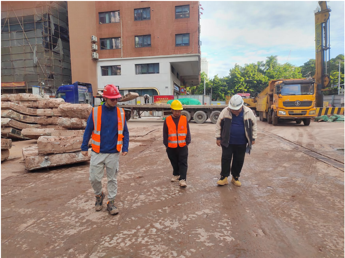
图 16 踏查工作（南-北）