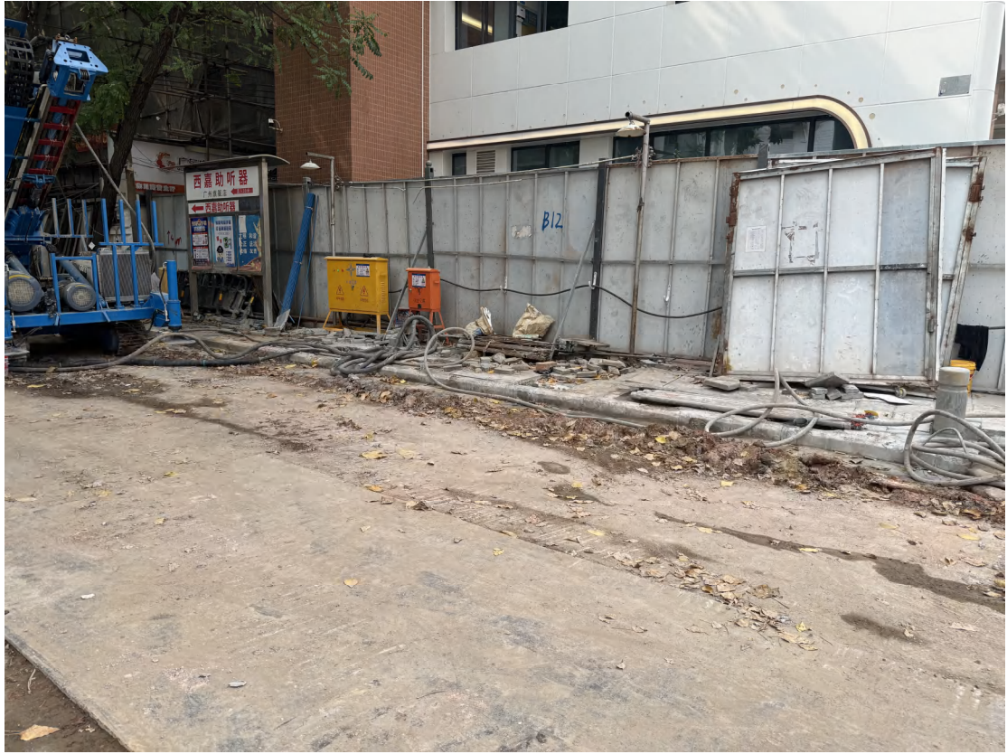
图 19 地块北部现状（东南-西北）