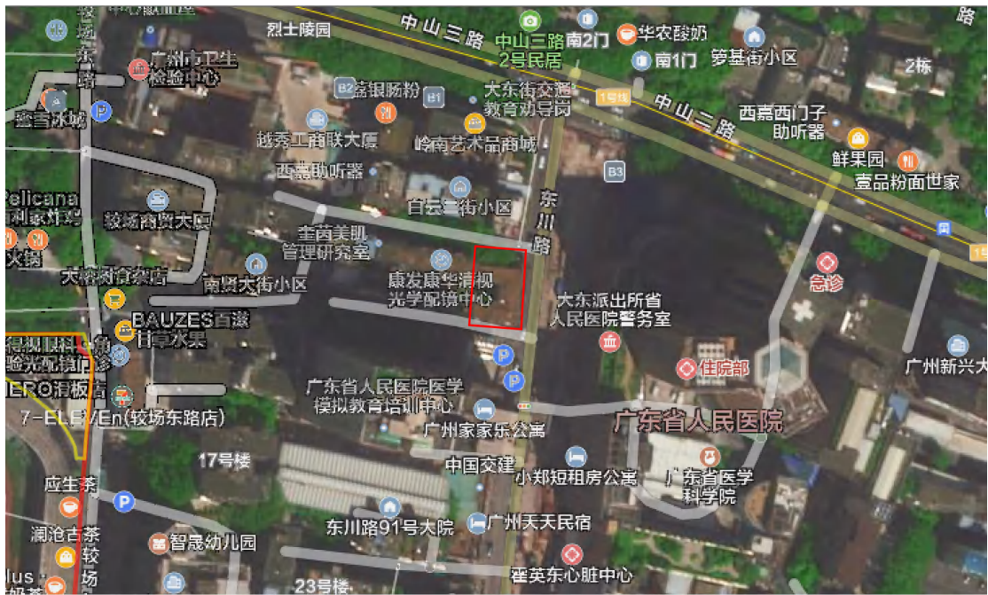
图 4 项目卫星影像图（腾讯卫星地图）