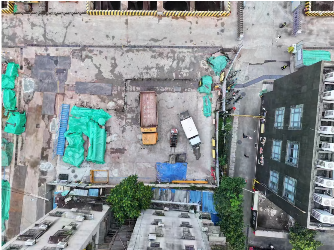
图 18 地块现状（俯视上为东）