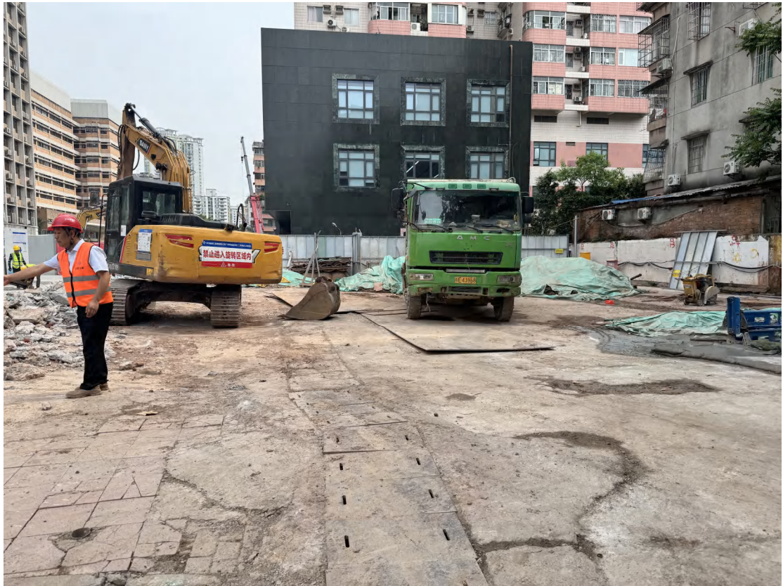
图 20 地块中现状（西北-东南）