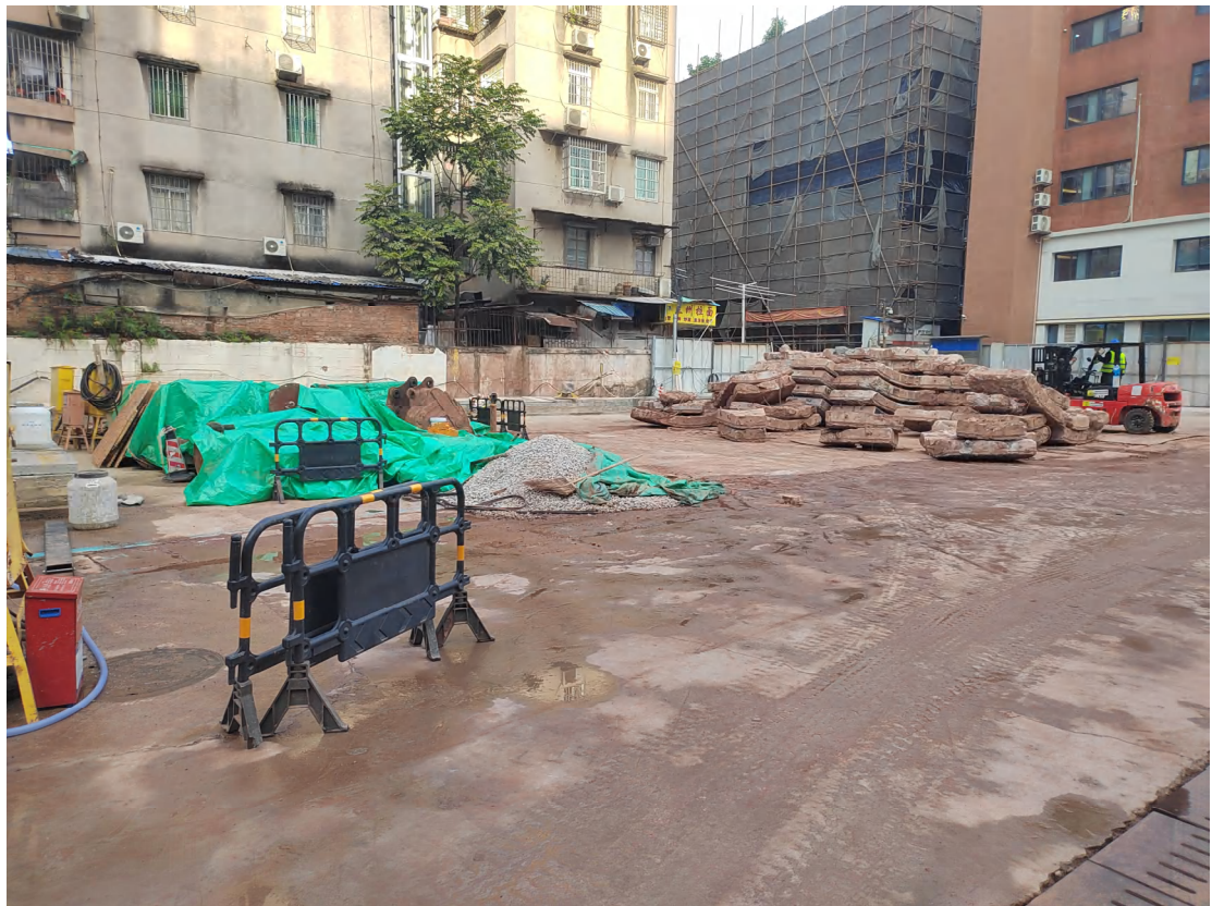
图 22 地块中西部现状（东南-西北）