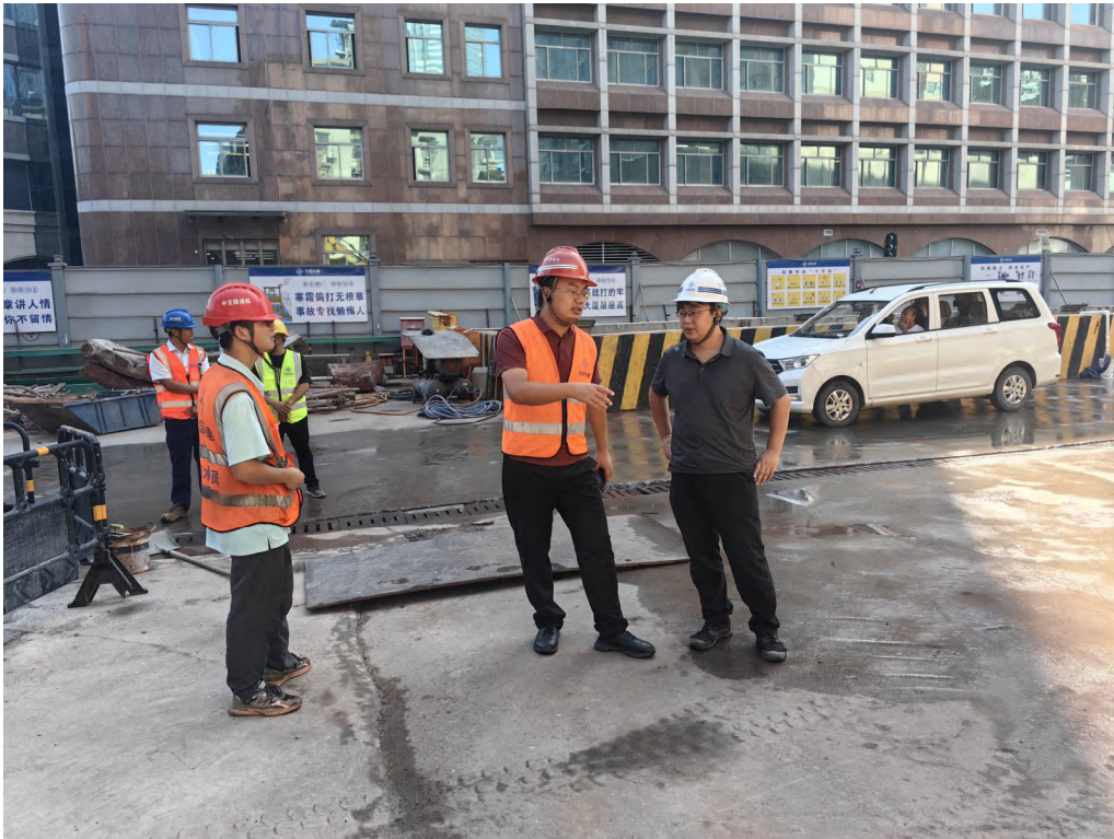
图 14 工作人员现场接洽（西北-东南）