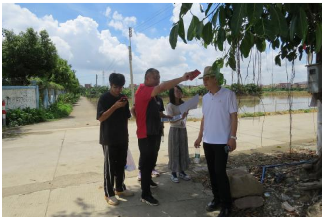
图 6 工作人员确认地块范围（北-南）