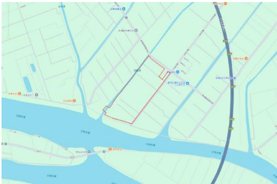
图 3 项目地块周边环境示意图（奥维地图）