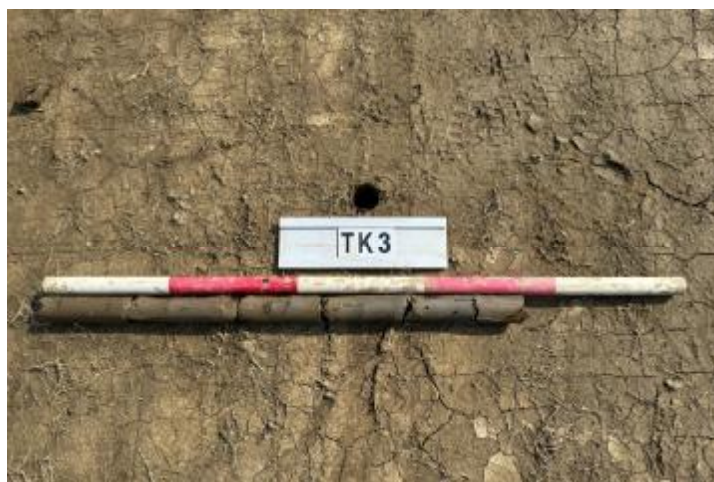
图 25 TK3 土样 (一米标杆, 土样由左往右)

②层: 淤积层, 距地表深 0.35-0.75 米, 厚 0.4 米, 为灰黑色淤泥, 土质较疏松, 内含石子等。以下渗水严重, 无法提取土样。