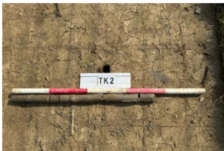
图 24 TK2 土样（一米标杆，土样由左往右）

②层：淤积层，距地表深 0.48-0.74 米，厚 0.26 米，为灰褐色淤泥，土质较疏松，内含石子等。以下渗水严重，无法提取土样。