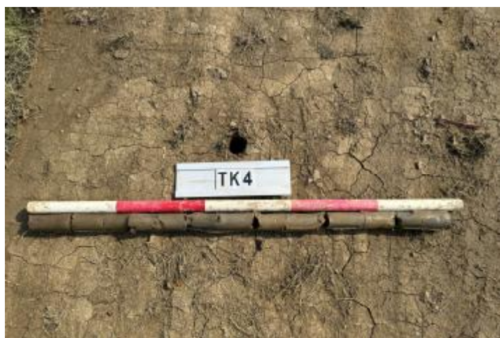
图 26 TK4 土样 (一米标杆, 土样由左往右)

②层: 淤积层, 距地表深 0.84-0.97 米, 厚 0.13 米, 为灰褐色淤泥, 土质较疏松, 内含石子等。以下渗水严重, 无法提取土样。