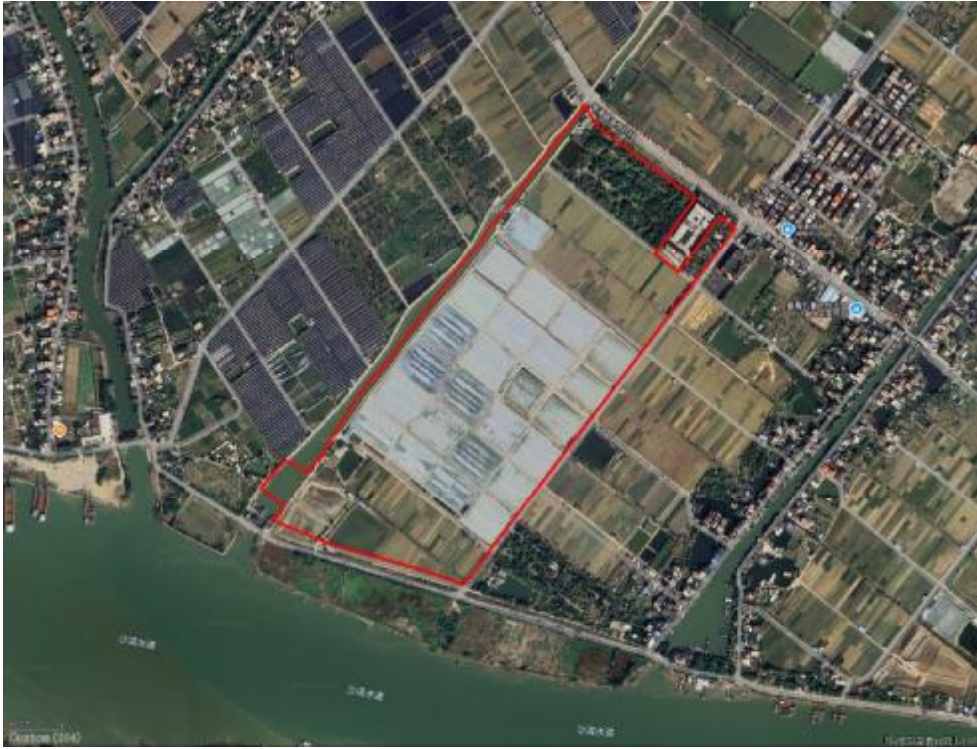
图 4 项目地块卫星红线图（奥维地图）