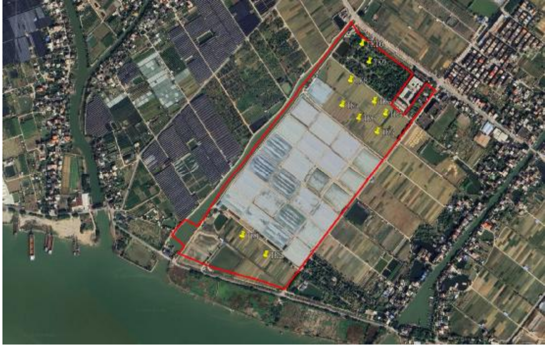
图 19 试探探孔位置分布图（黄色标记点）

为进一步了解并掌握该地块内地层堆积情况，我们在地块范围内进行了试探。提取 10 个标准型探孔，编号为 TK1-TK10，具体情况如下：