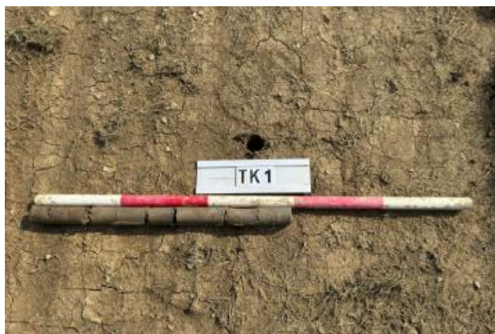
图 23 TK1 土样（一米标杆，土样由左往右）

②层：淤积层，距地表深 0.33-0.59 米，厚 0.26 米，为灰褐色淤泥，土质较疏松，内含石子等。以下渗水严重，无法提取土样。