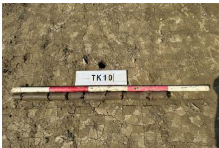
图 32 TK10 土样 (一米标杆, 土样由左往右)

②层: 淤积层, 距地表深 0.38-0.79 米, 厚 0.41 米, 为灰褐色淤泥, 土质较疏松, 内含石子等。以下渗水严重, 无法提取土样。