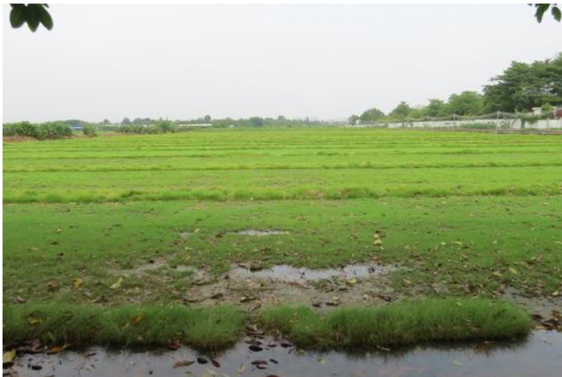
图 17 地块内现状（东南-西北）