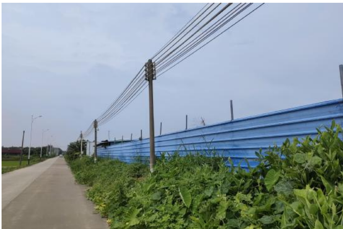
图 18 地块内现状（东南-西北）