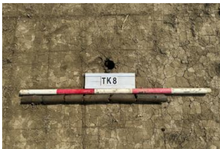
图 30 TK8 土样 (一米标杆, 土样由左往右)

②层: 淤积层, 距地表深 0.62-0.87 米, 厚 0.25 米, 为灰黑色淤泥, 土质较疏松, 内含石子等。以下渗水严重, 无法提取土样。