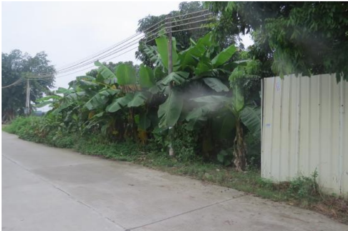
图 12 地块内现状（东南-西北）