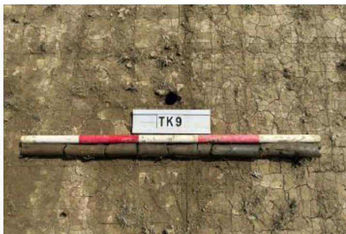
图 31 TK9 土样 (一米标杆, 土样由左往右)

②层: 淤积层, 距地表深 0.35-1.0 米, 厚 0.65 米, 为灰黑色淤泥, 土质较疏松, 内含石子等。以下渗水严重, 无法提取土样。