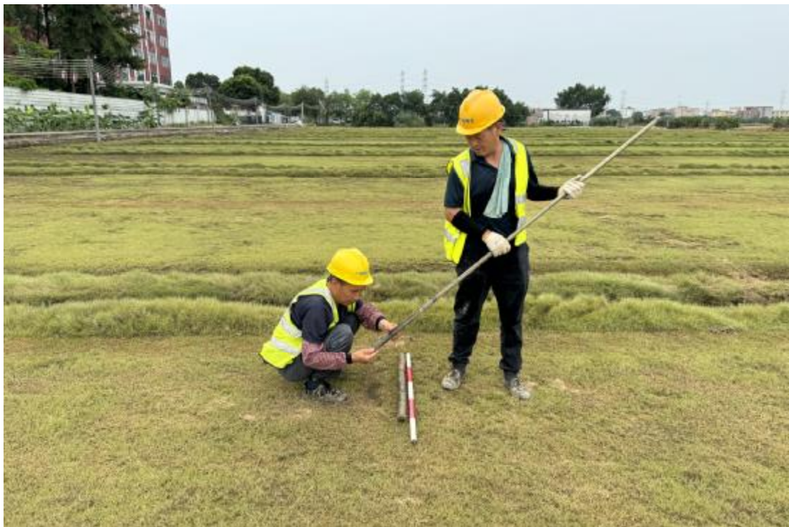
图 22 土样分析（西北-东南）