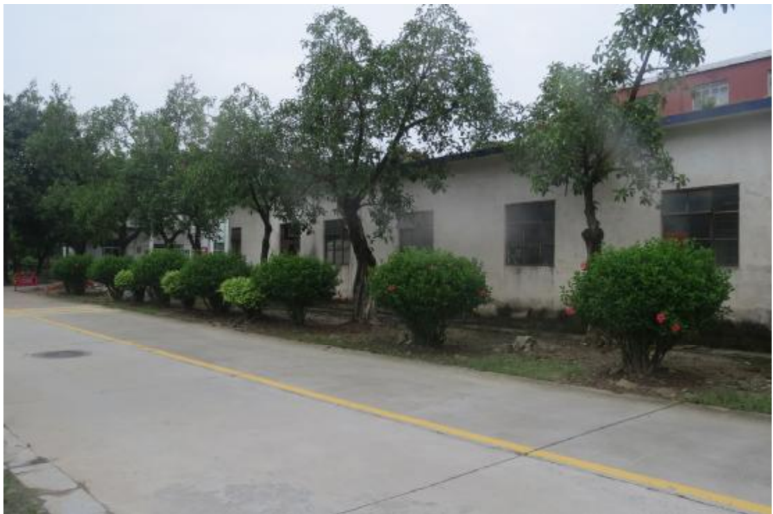
图 10 地块内现状（东南-西北）