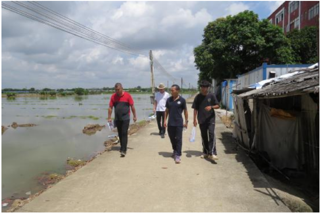
图 7 现场踏查（东-西）