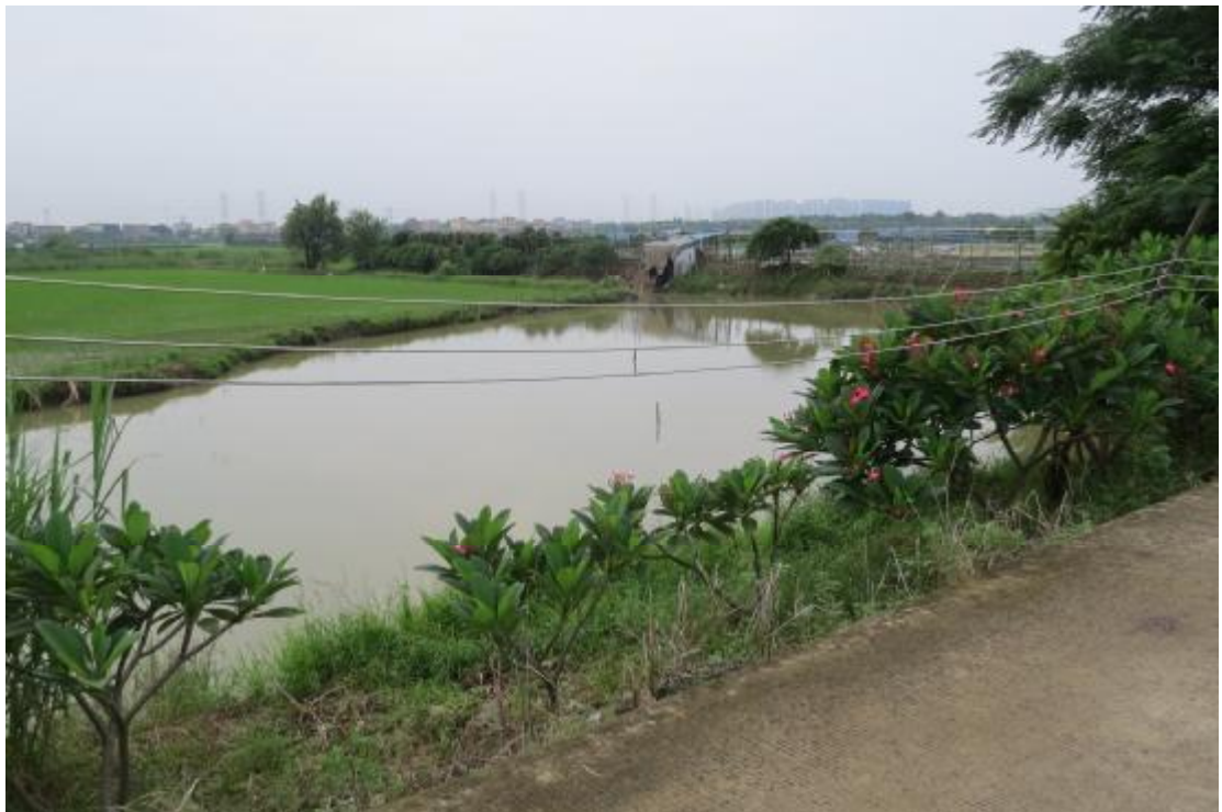
图 8 地块内现状（南-北）