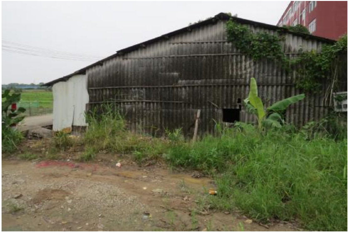
图 13 地块内现状（东南-西北）