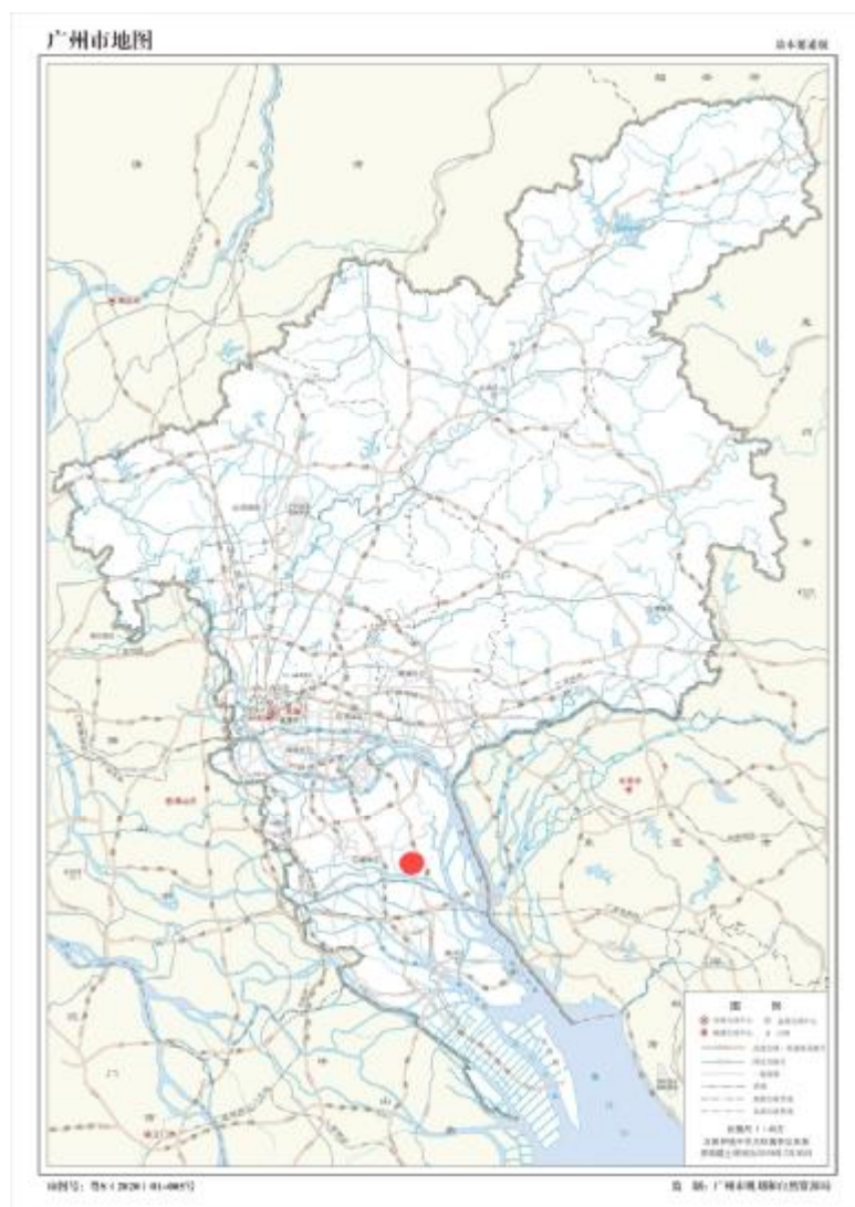
图 1 项目地块在广州市位置示意图（广州市规划和自然资源局）

根据《中华人民共和国文物保护法》《广州市文物保护规定》，按照《广州市文物局关于番禺区 2024 年度第四十五、四十六、四十七、五十六批次城镇建设用地考古调查勘探工作的复函》（文物 20240596 号）指导意见，受广州市番禺区土地开发中心委托，由我院负责该地块的考古调查工作。