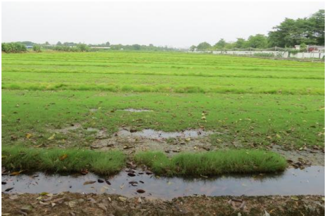
图 16 地块内现状（东南-西北）