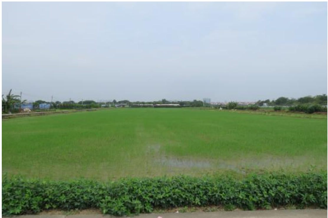
图 14 地块内现状（东南-西北）