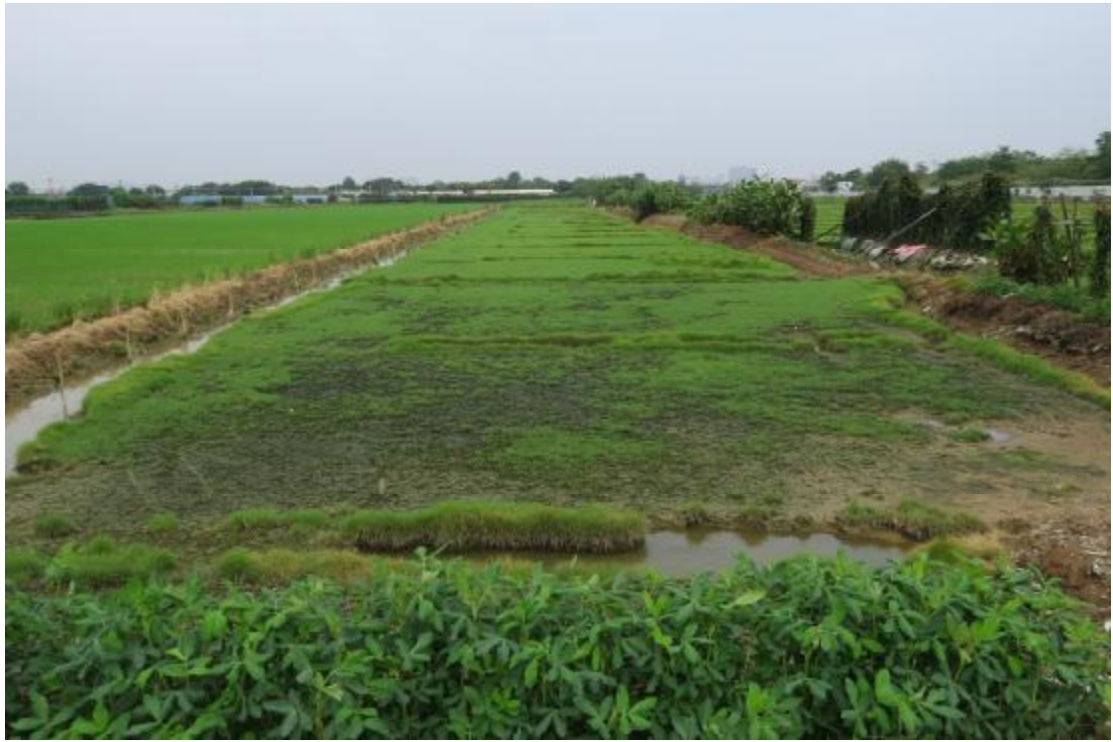
图 15 地块内现状（东南-西北）