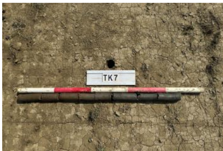
图 29 TK7 土样 (一米标杆, 土样由左往右)

②层: 淤积层, 距地表深 0.4-0.87 米, 厚 0.47 米, 为灰黑色淤泥, 土质较疏松, 内含石子等。以下渗水严重, 无法提取土样。