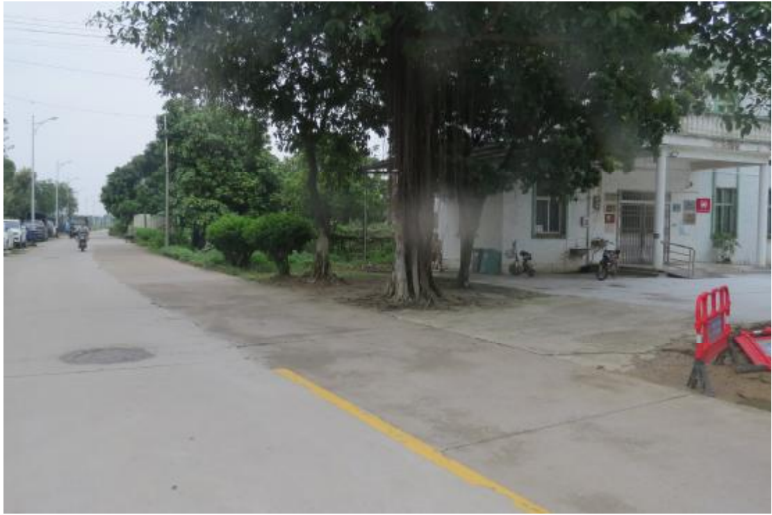
图 11 地块内现状（东南-西北）