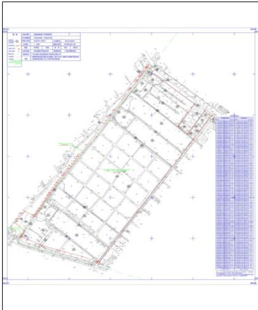
图 5 项目地块地形红线图