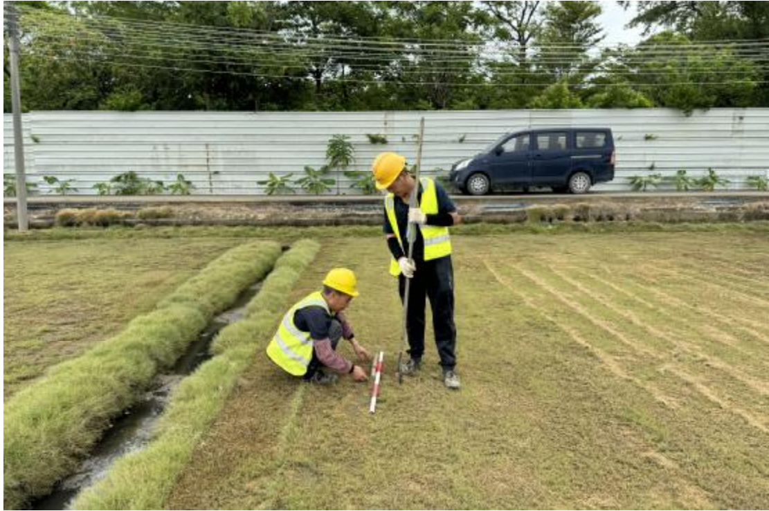
图 21 土样提取（东-西）