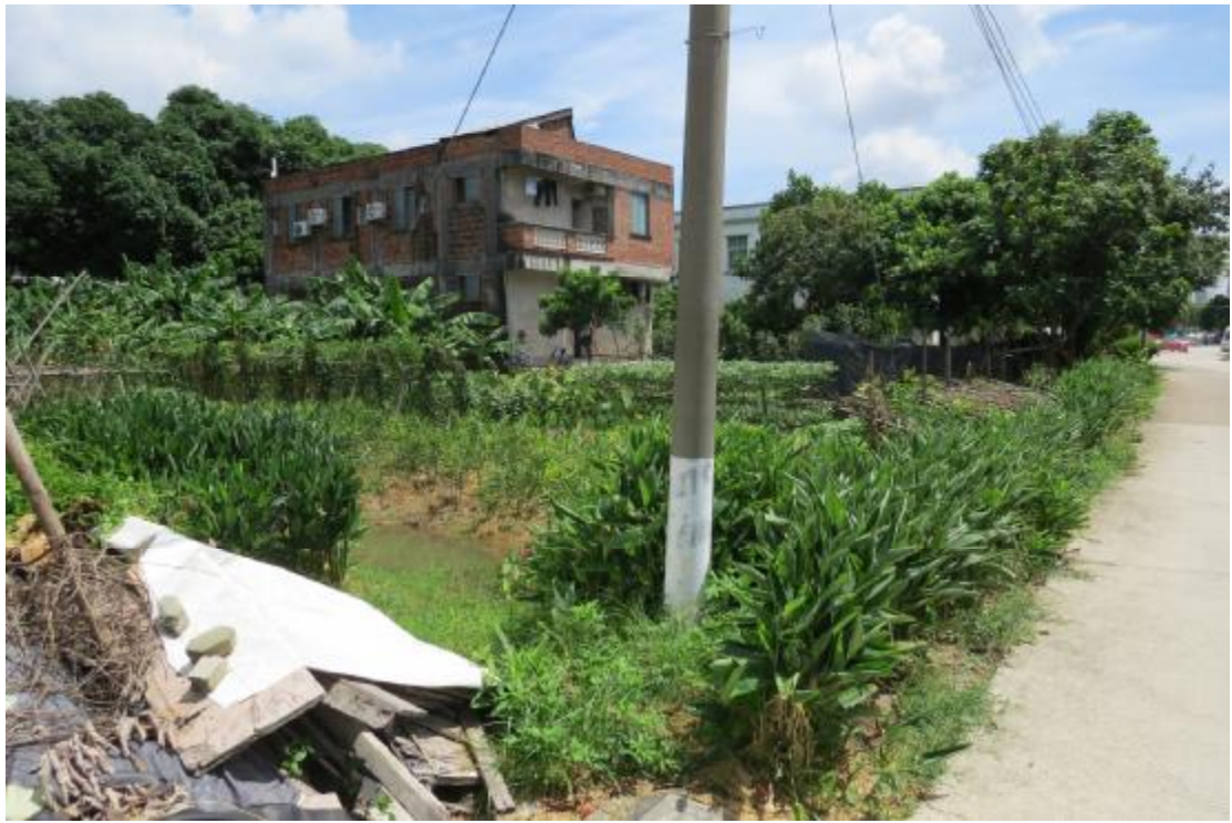
图 9 地块内现状（西南-东北）