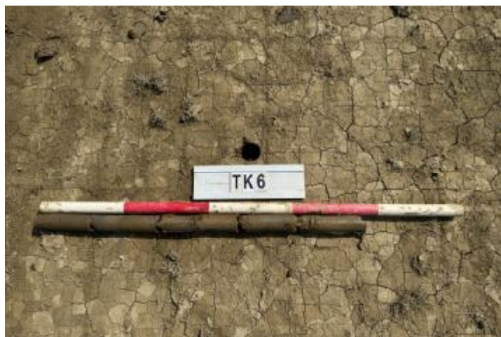
图 28 TK6 土样 (一米标杆, 土样由左往右)

②层: 淤积层, 距地表深 0.46-0.76 米, 厚 0.3 米, 为灰黑色淤泥, 土质较疏松, 内含石子等。以下渗水严重, 无法提取土样。