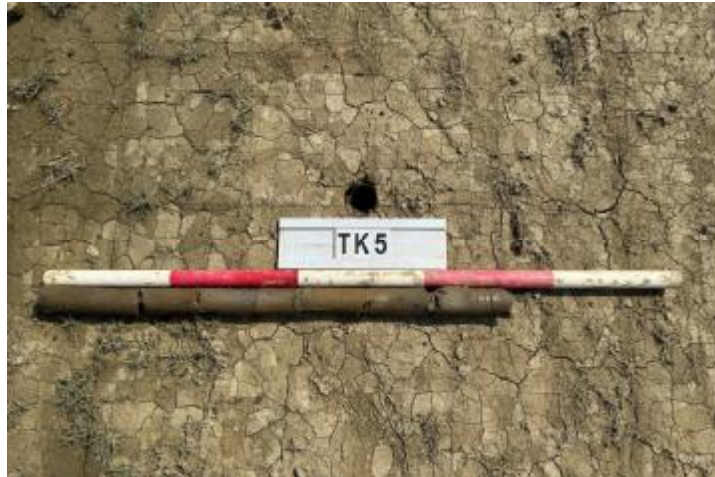
图 27 TK5 土样 (一米标杆, 土样由左往右)

②层: 淤积层, 距地表深 0.55-0.75 米, 厚 0.2 米, 为灰黑色淤泥, 土质较疏松, 内含石子等。以下渗水严重, 无法提取土样。