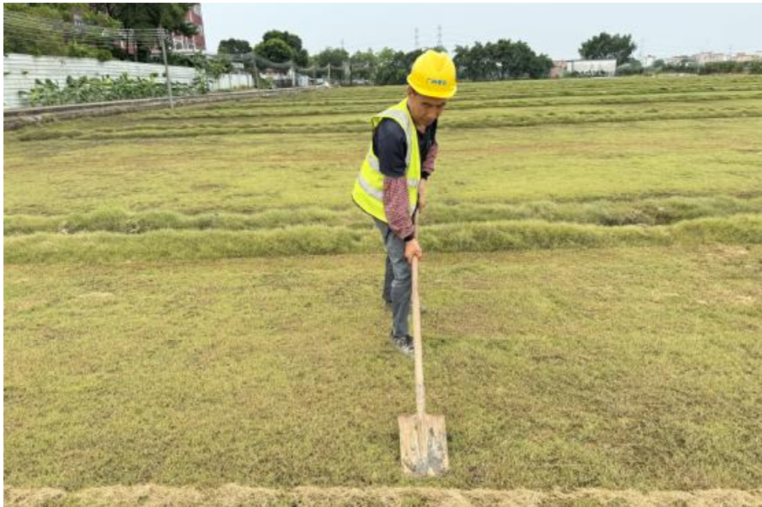
图 20 地表清理（西北-东南）