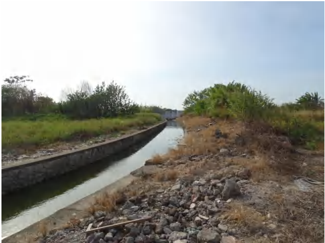
图 32 地块地表现状（北-南）