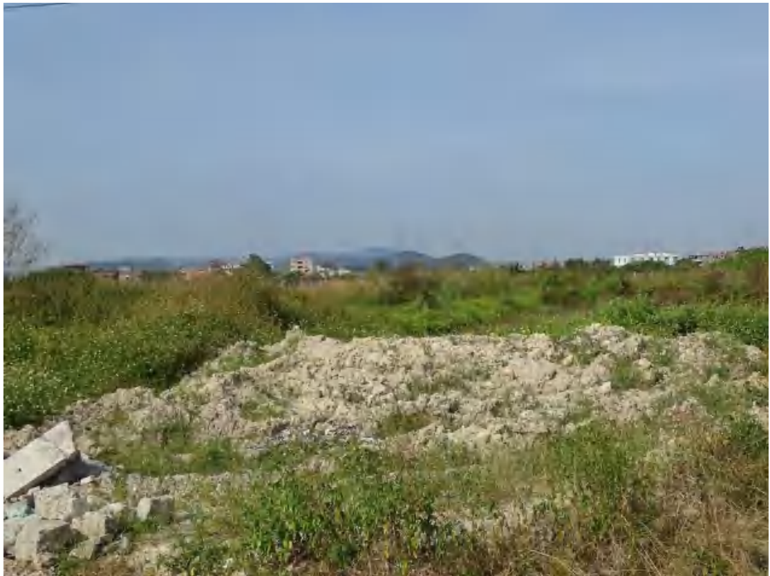
图 8 地块地表现状（南-北）