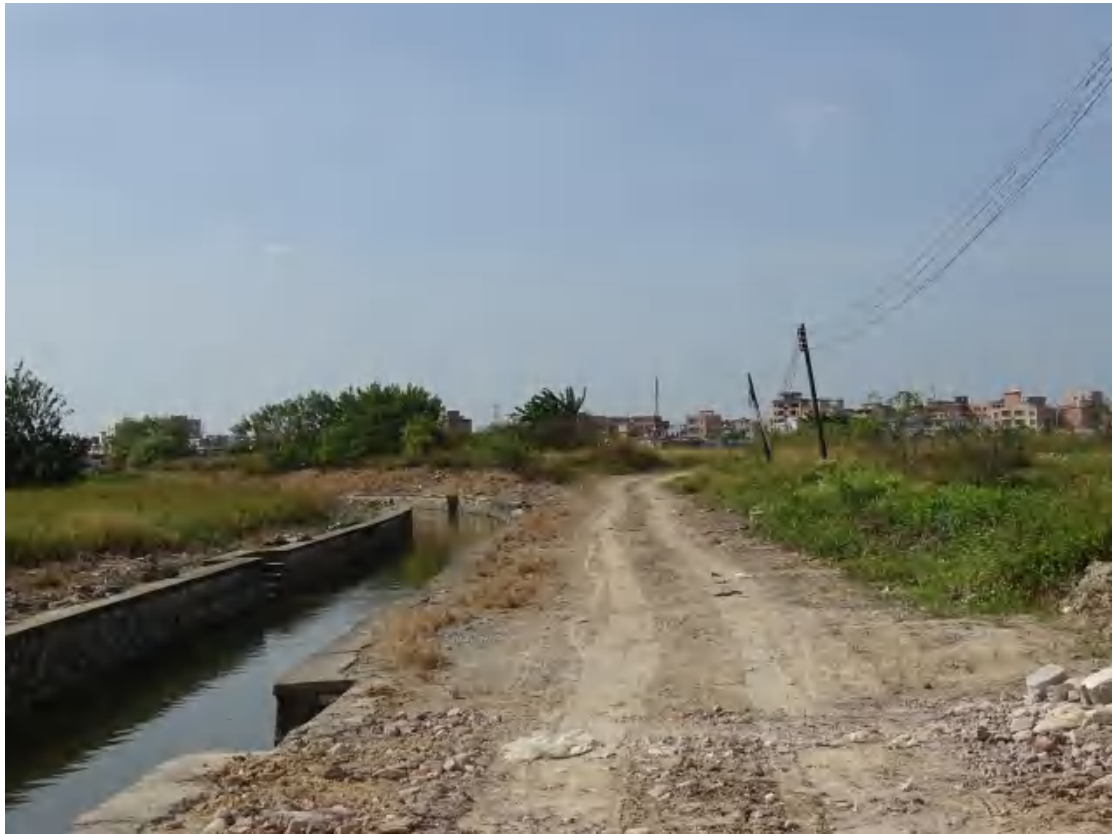
图 9 地块地表现状（东-西）