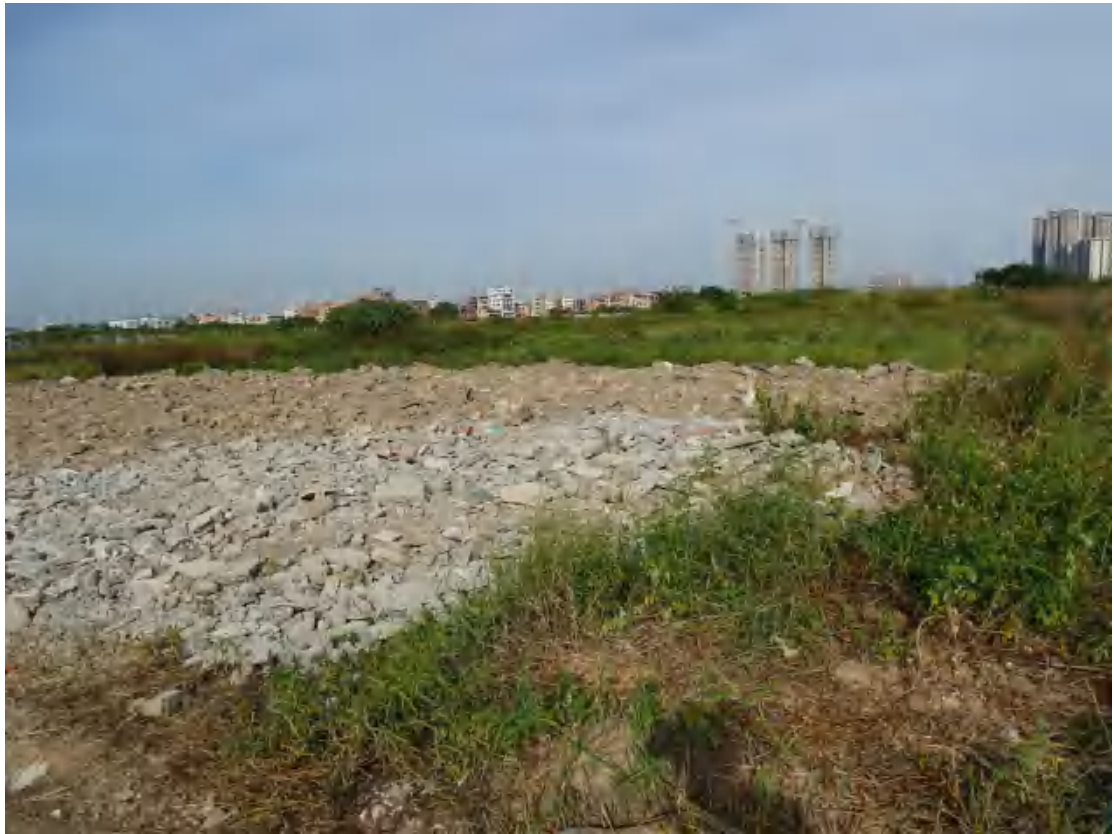
图 17 地块地表现状（南-北）