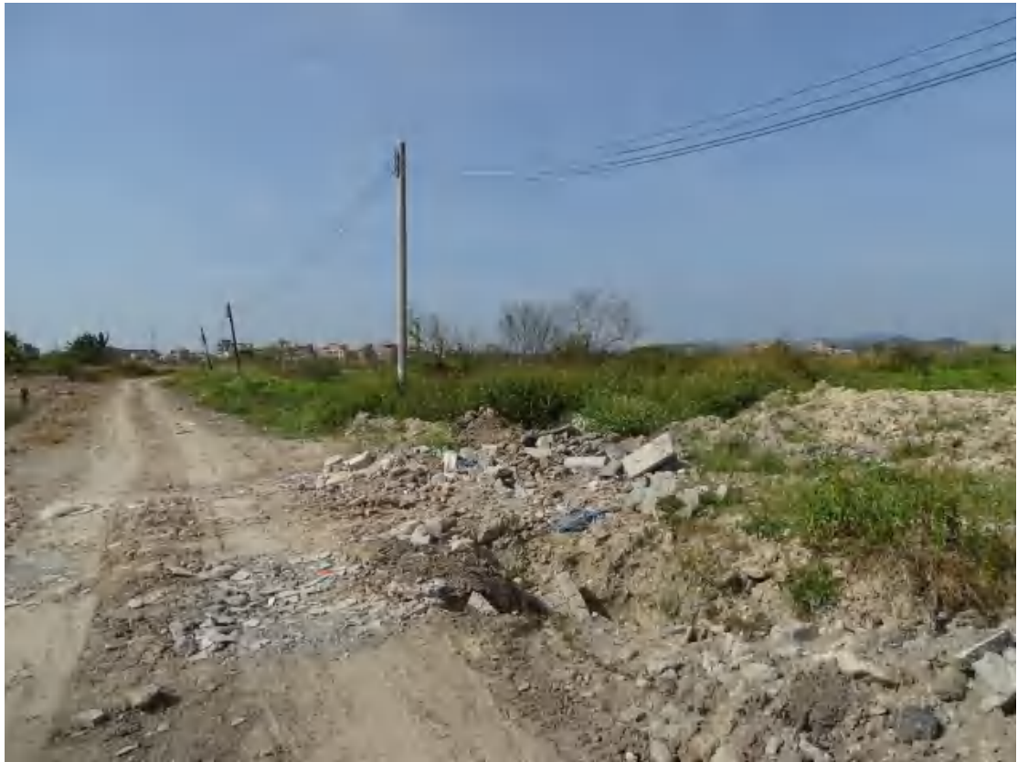
图 7 地块地表现状（东-西）