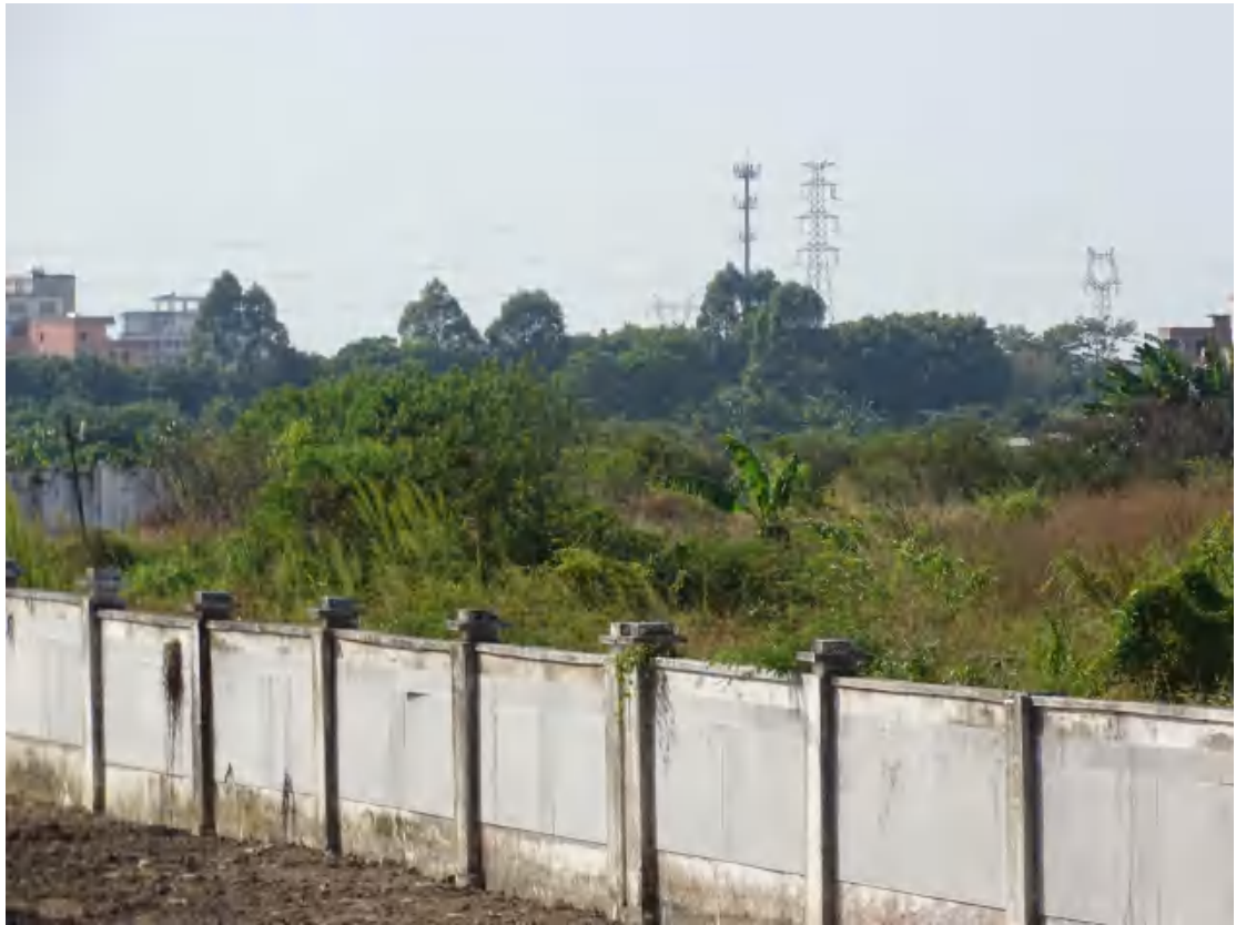
图 11 地块地表现状（东-西）