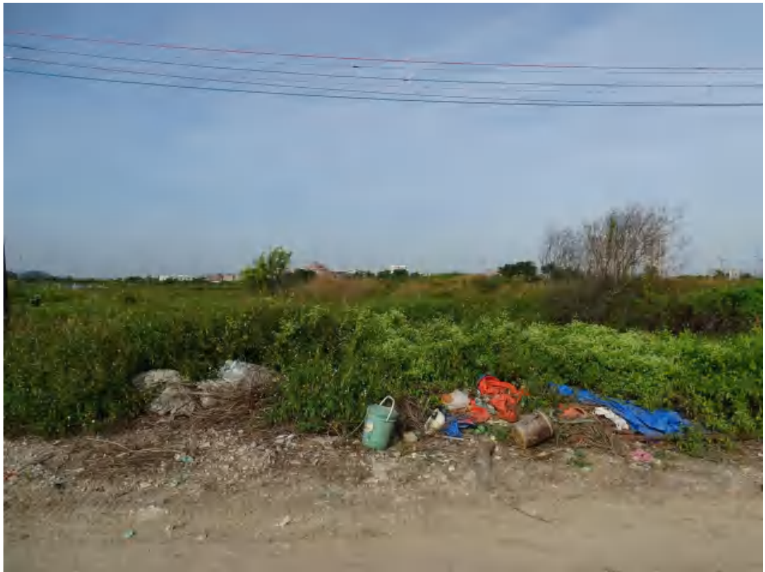
图 34 地块地表现状（南-北）