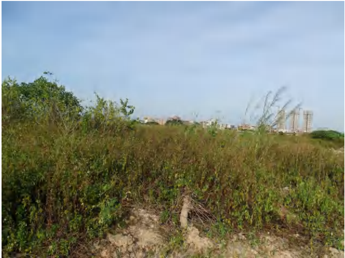
图 25 地块地表现状（南-北）