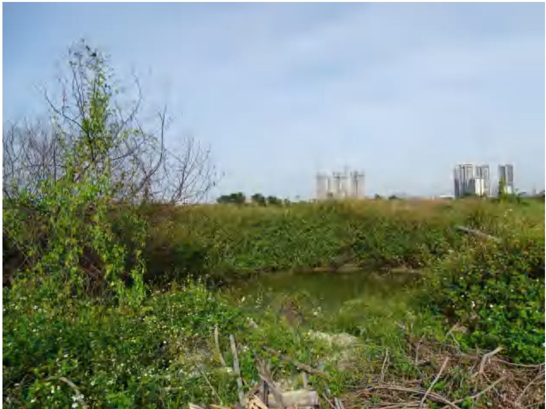
图 14 地块地表现状（南-北）