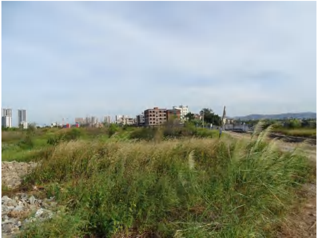
图 31 地块地表现状（南-北）