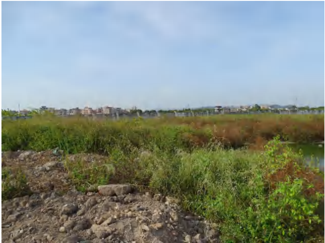
图 23 地块地表现状（东-西）