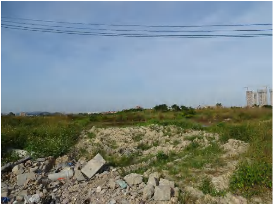
图 35 地块地表现状（南-北）