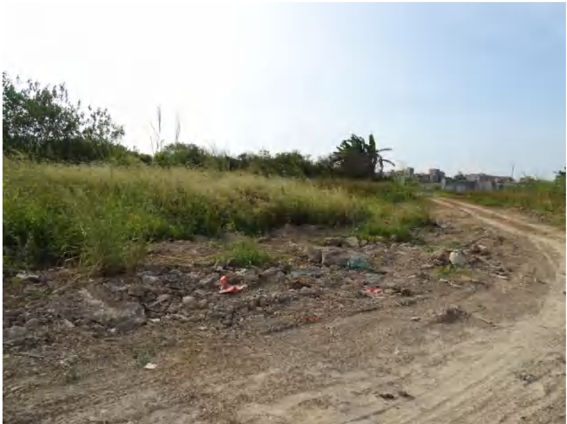
图 30 地块地表现状（东-西）