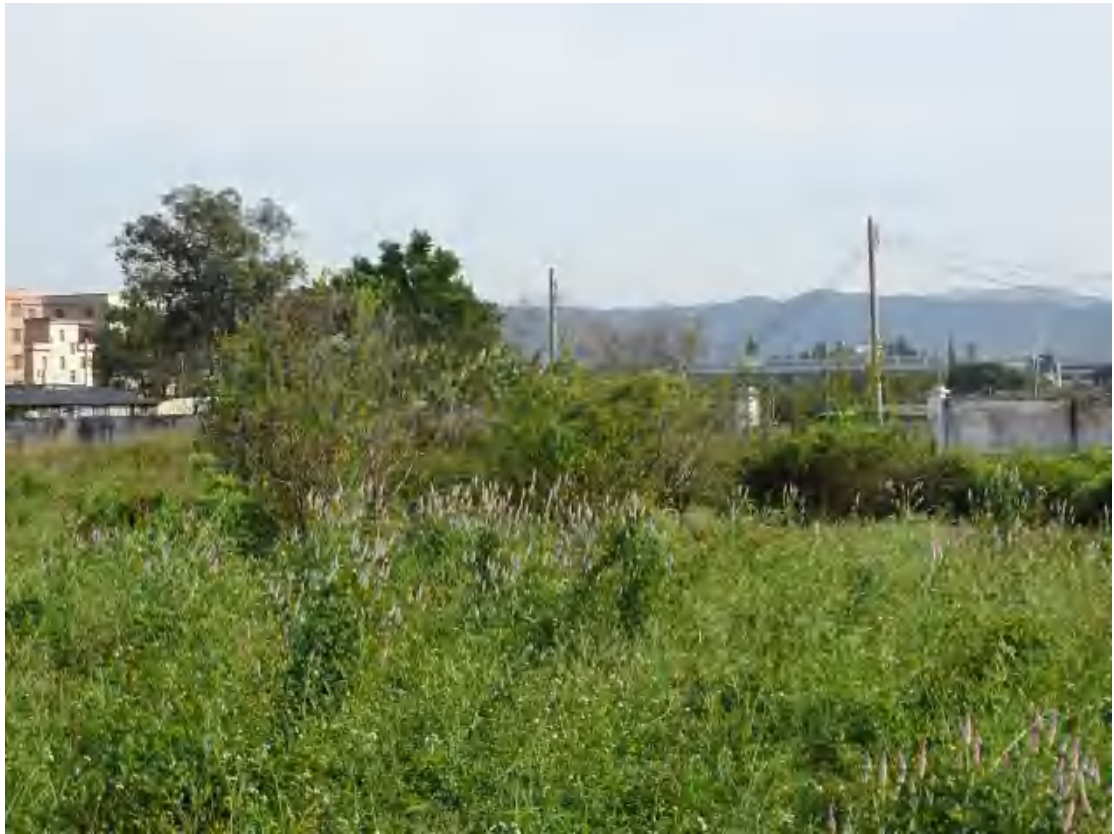
图 21 地块地表现状（西-东）