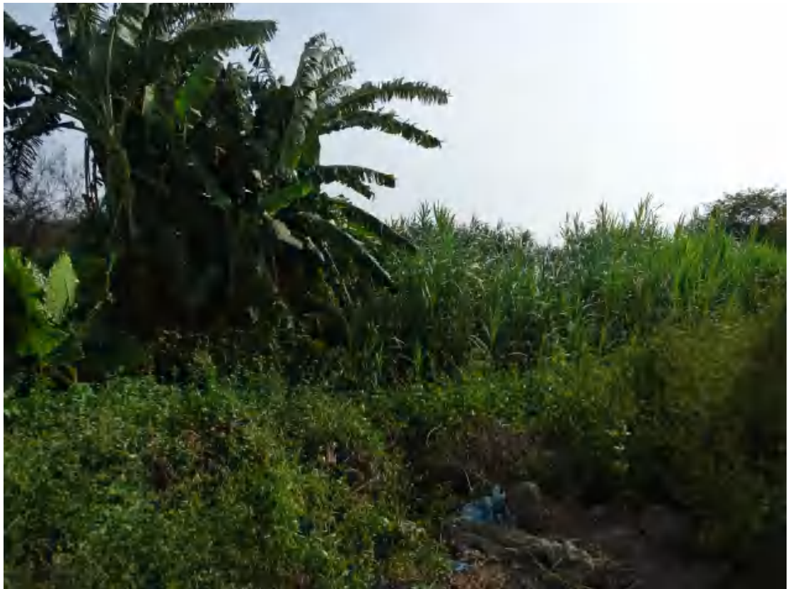
图 26 地块地表现状（东-西）