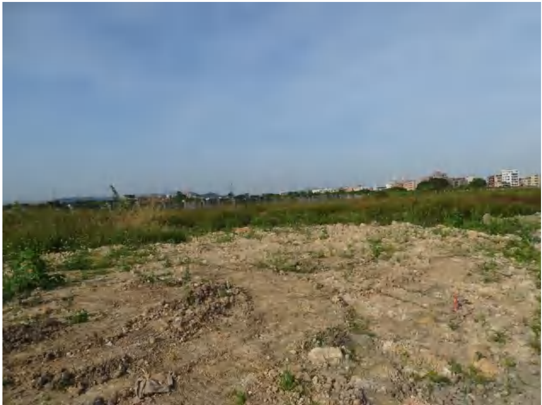
图 24 地块地表现状（南-北）