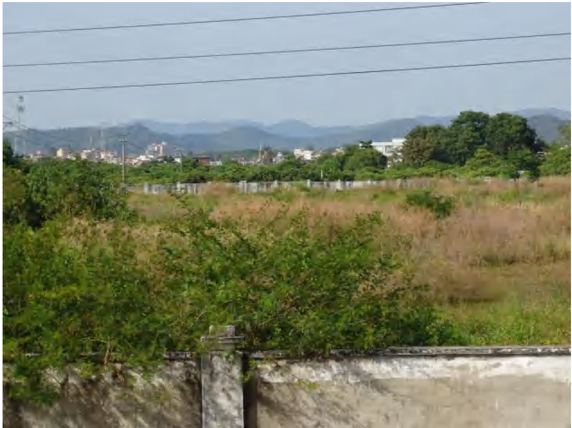
图 10 地块地表现状（南-北）