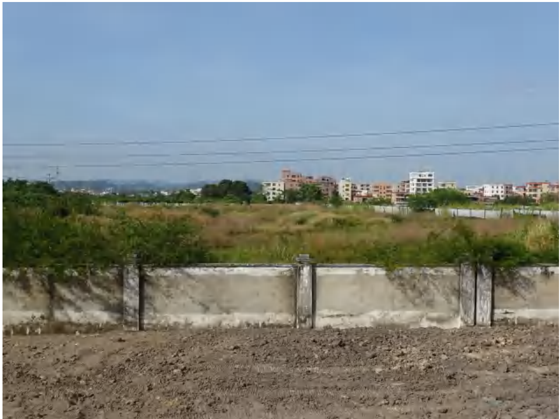
图 12 地块地表现状（东-西）