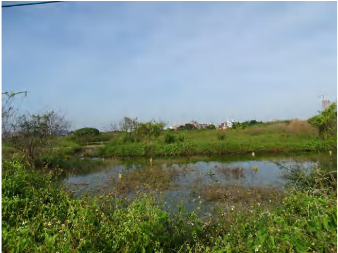
图 15 地块地表现状（南-北）