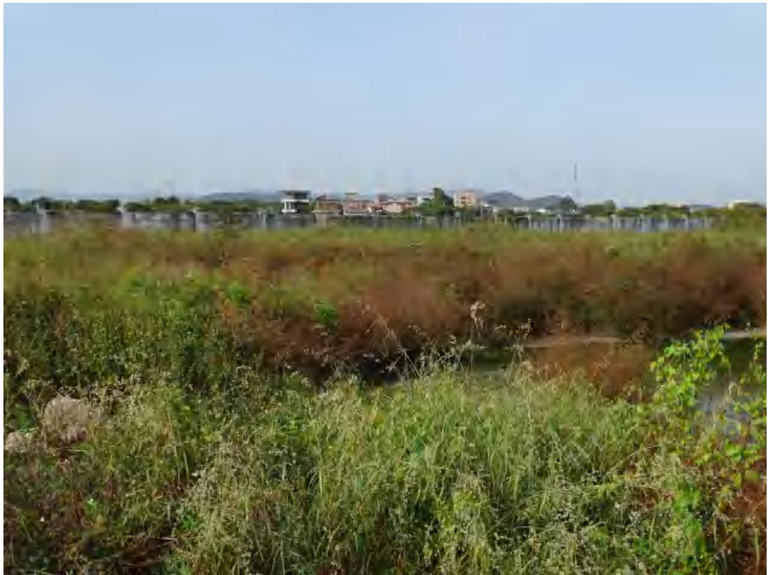
图 20 地块地表现状（南-北）