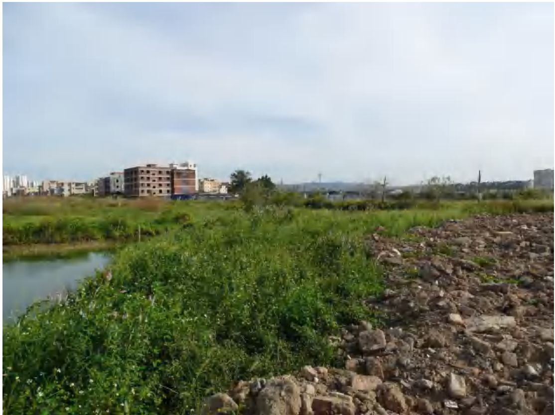
图 22 地块地表现状（西-东）