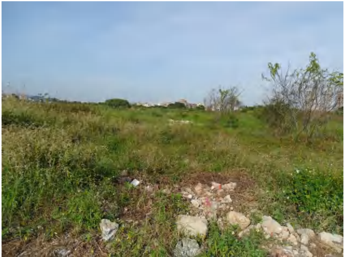
图 16 地块地表现状（南-北）