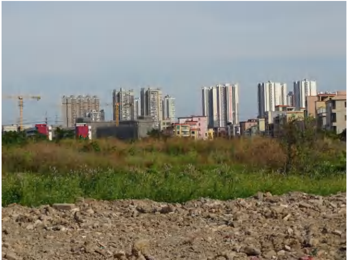
图 29 地块地表现状（南-北）