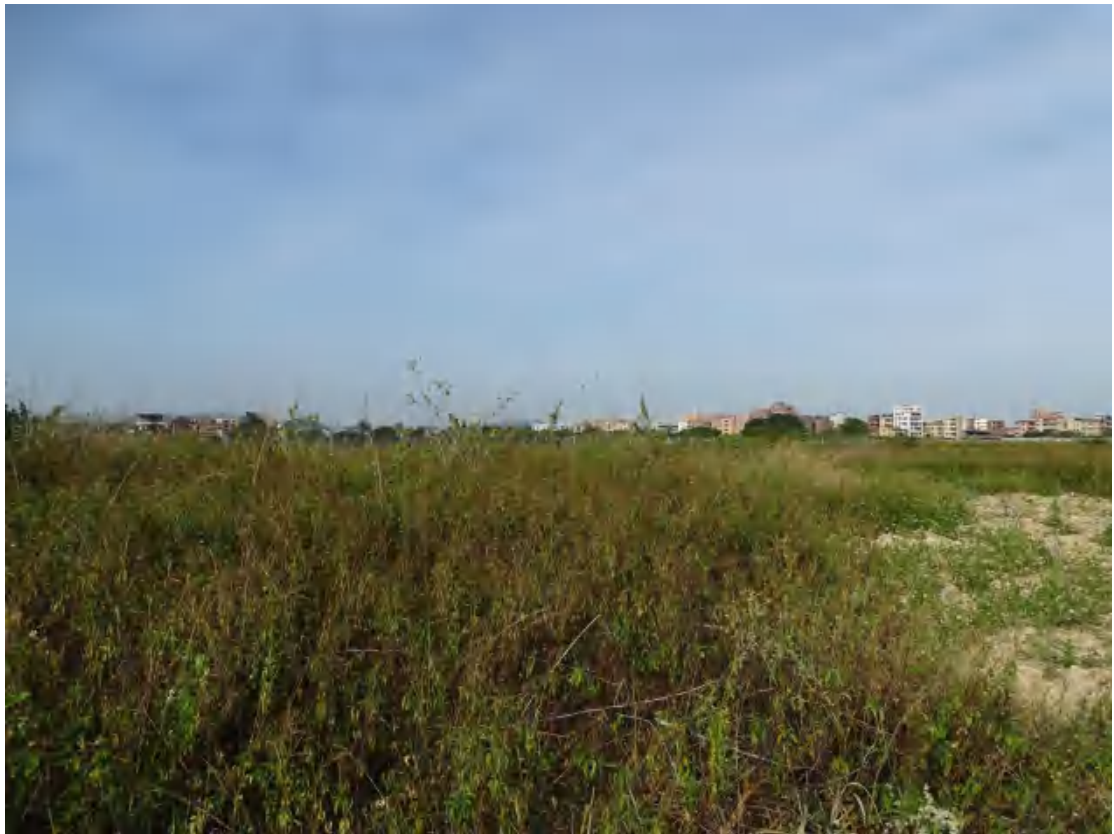
图 28 地块地表现状（西-东）