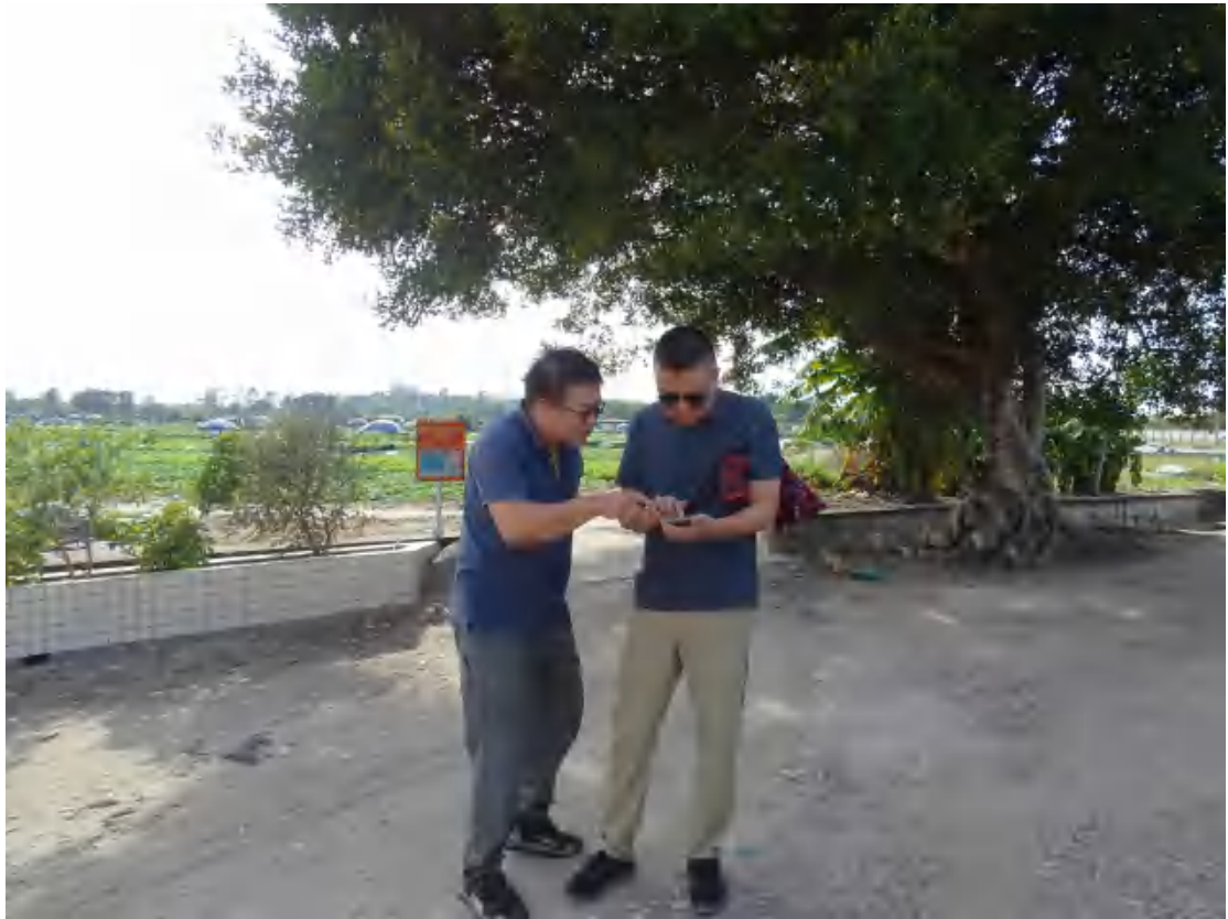
图 5 与现场工作人员确定地块范围（北-南）