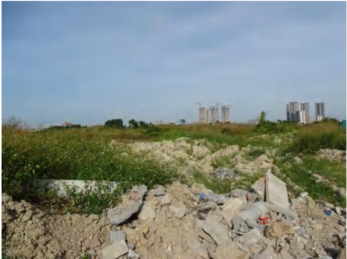
图 13 地块地表现状（南-北）