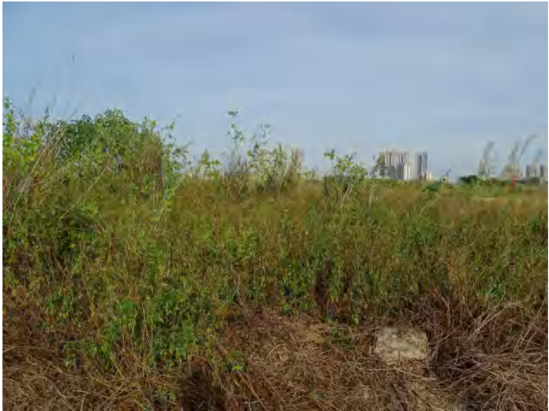
图 27 地块地表现状（北-南）