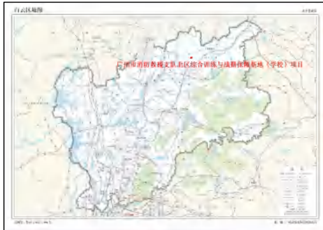
图 2 地块在白云区的位置示意图（标准地图）