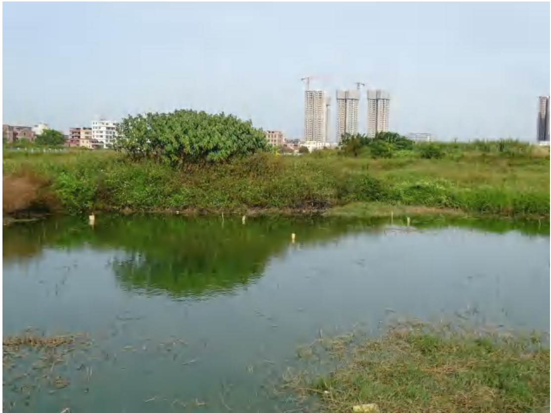
图 19 地块地表现状（南-北）