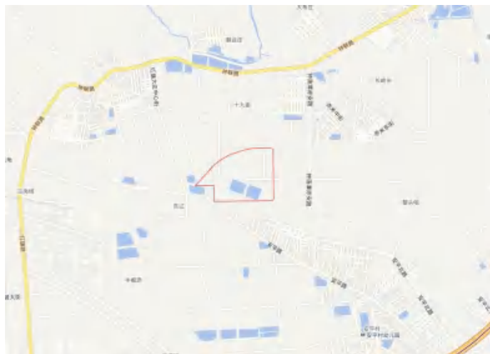
图 4 地块周边环境示意图（天地图）