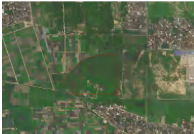
图 3 地块卫星红线图（世纪空间卫星影像图）