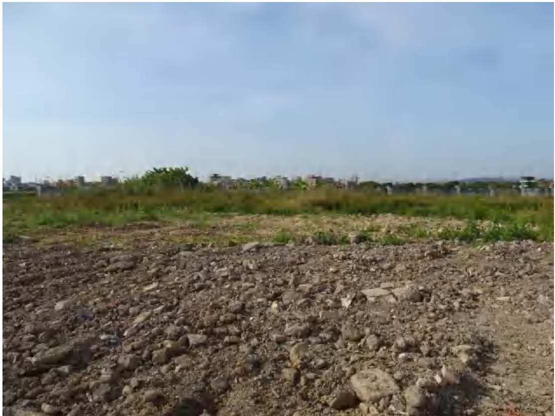
图 18 地块地表现状（南-北）