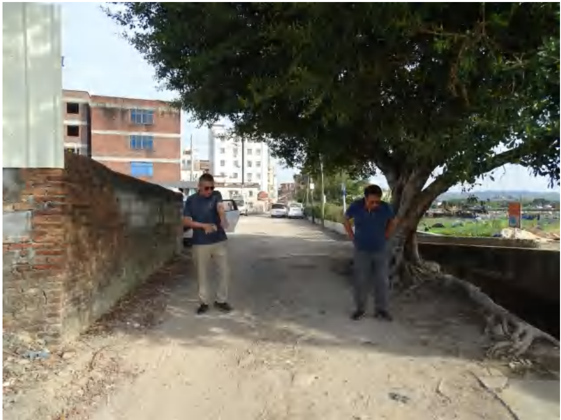
图 6 对地块地表进行踏查（西-东）