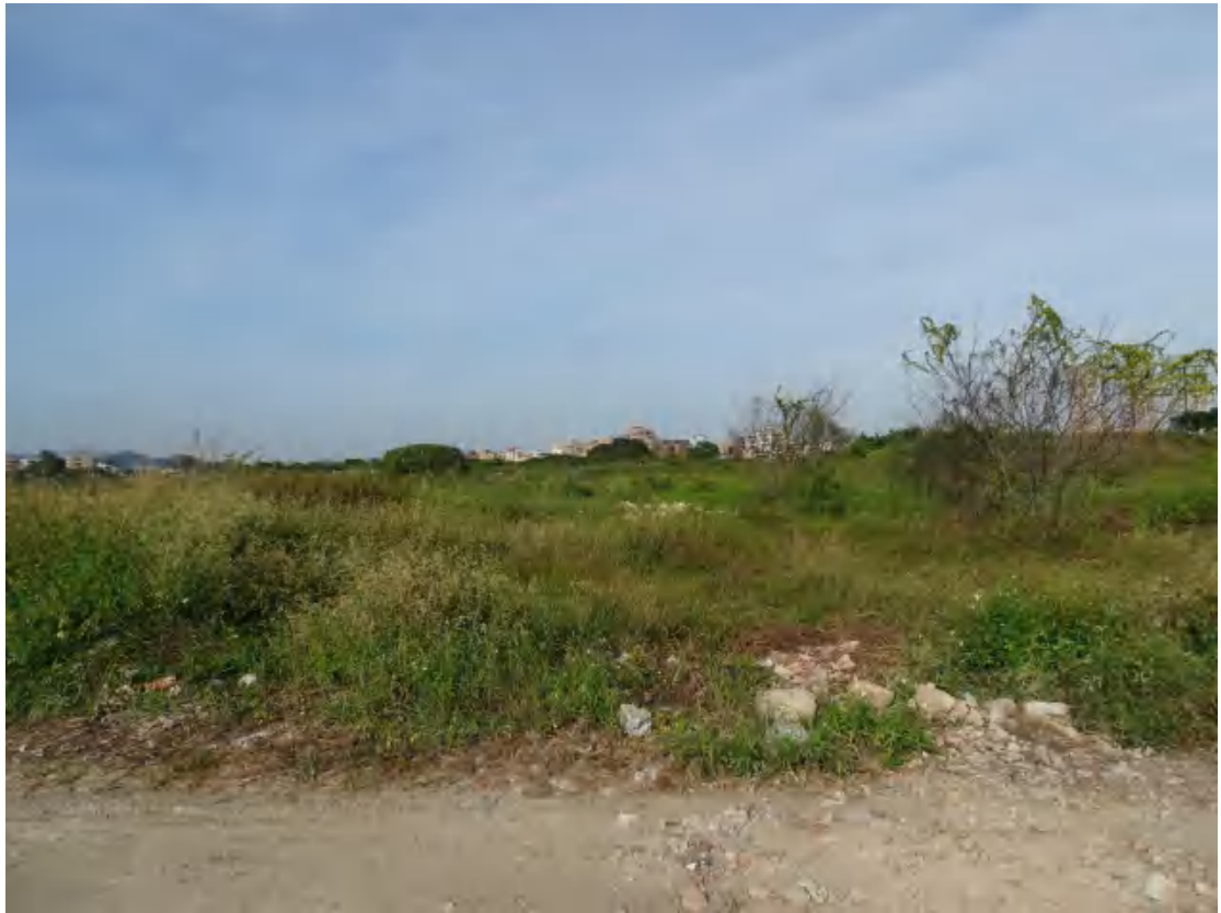
图 33 地块地表现状（南-北）