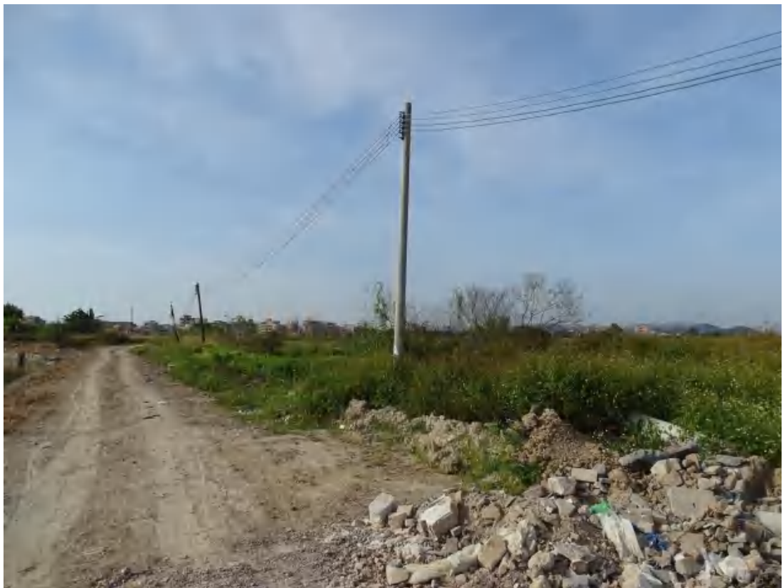
图 36 地块地表现状（东-西）