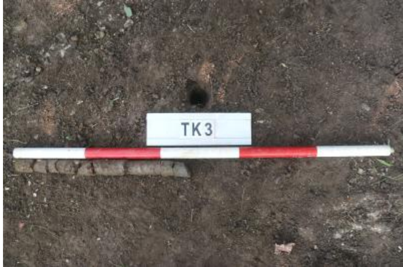
图 32 TK3 土样（一米标杆，土样由左往右）

①层：垫土层，距地表深 0-0.45 米，厚 0.45 米，为灰褐色黏土，土质较疏松，内含植物根系、红砖碎块及石子等。以下遇大石块阻拦，无法提取土样。