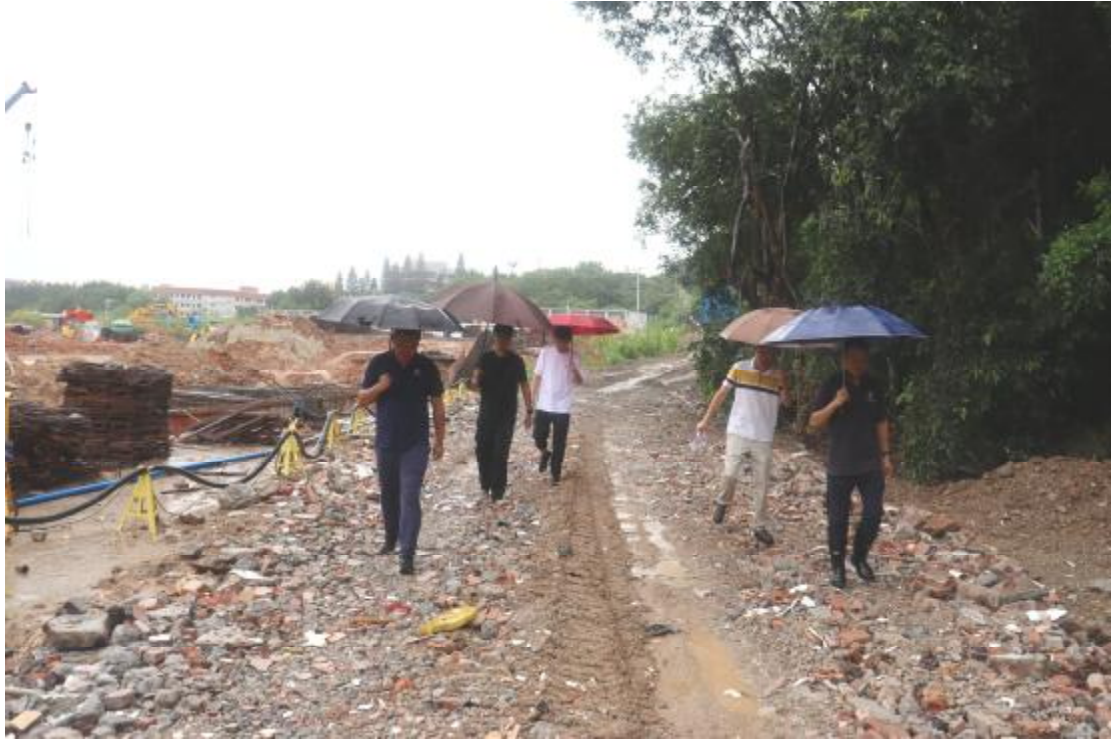
图 6 现场踏查（南-北）