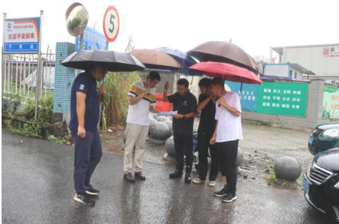
图 5 工作人员确认地块范围(东-西)