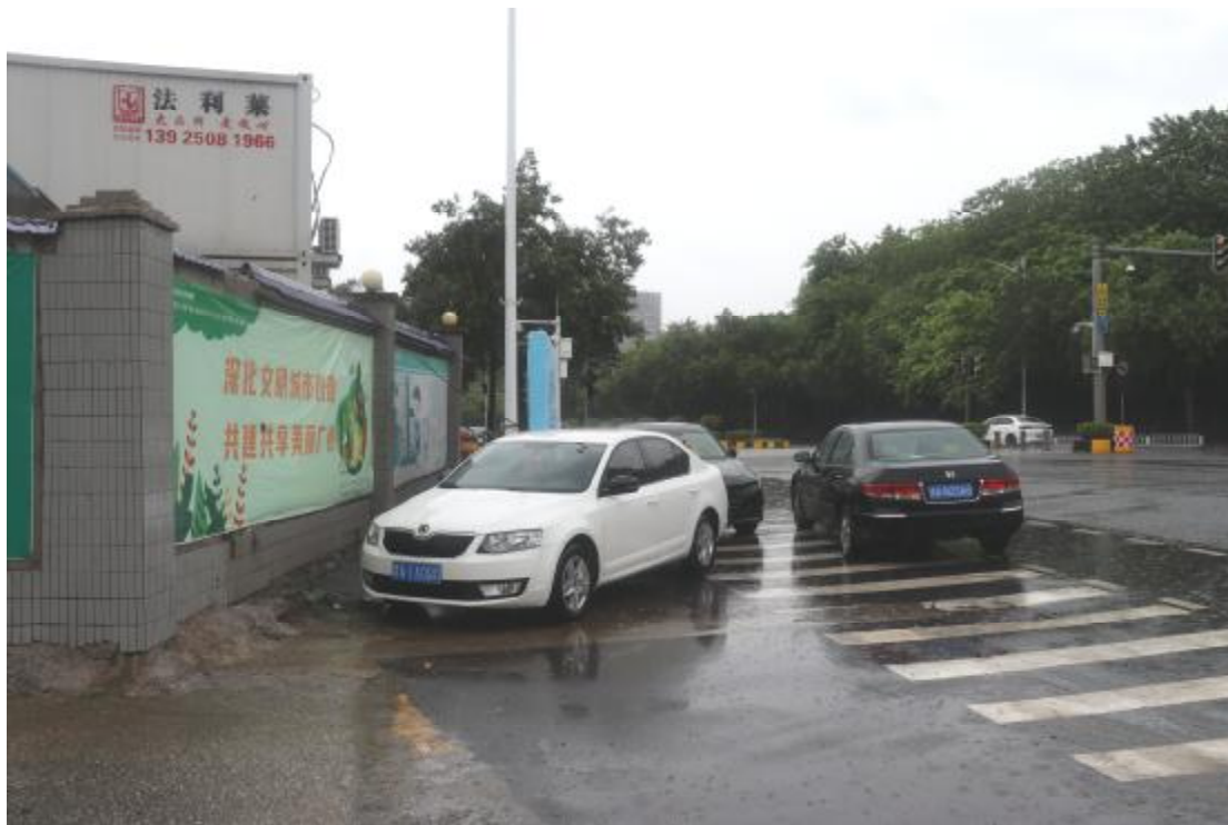
图 12 地块内现状（东南-西北）