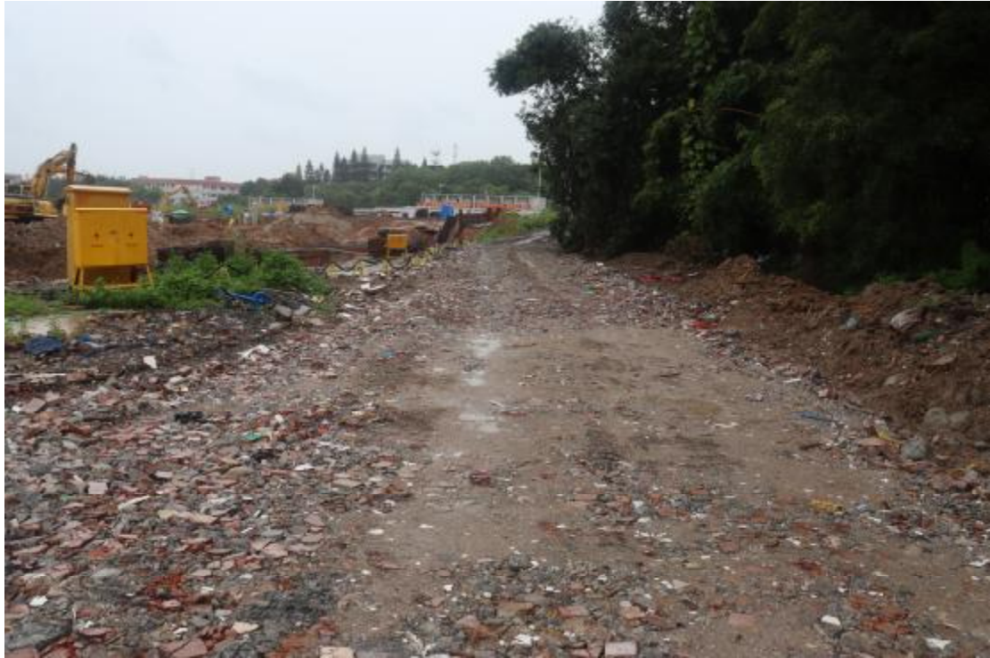
图 8 地块内现状（南-北）