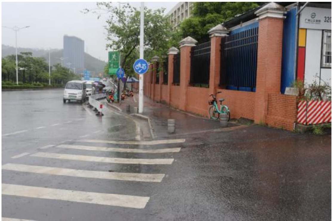
图 11 地块内现状（西-东）