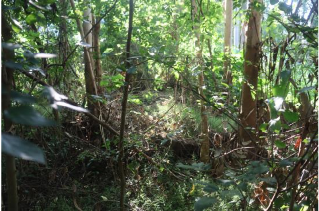
图 24 地块内现状（西北-东南）