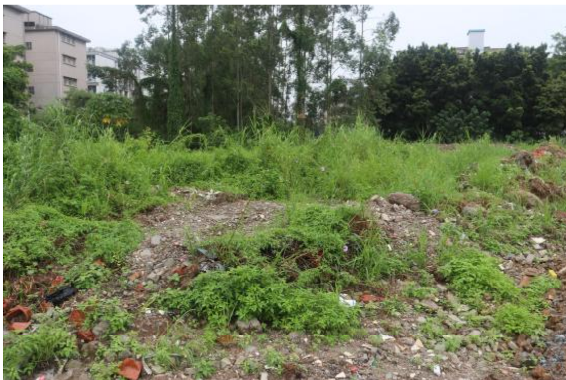
图 13 地块内现状（西北-东南）