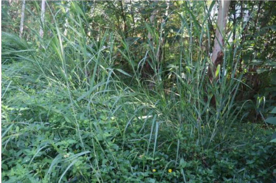
图 16 地块内现状（东南-西北）