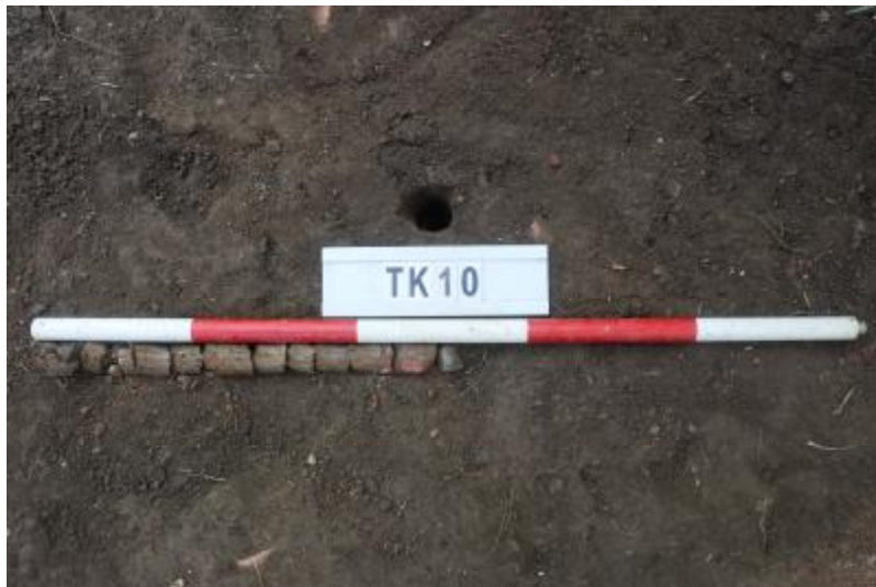
图 39 TK10 土样（一米标杆，土样由左往右）

①层：垫土层，距地表深 0-0.5 米，厚 0.5 米，为灰褐色黏土，土质较疏松，内含植物根系、红砖碎块及石子等。以下遇大石块阻拦，无法提取土样。