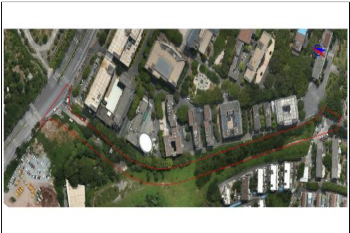
图 4 项目地块卫星影像图(建设单位提供)