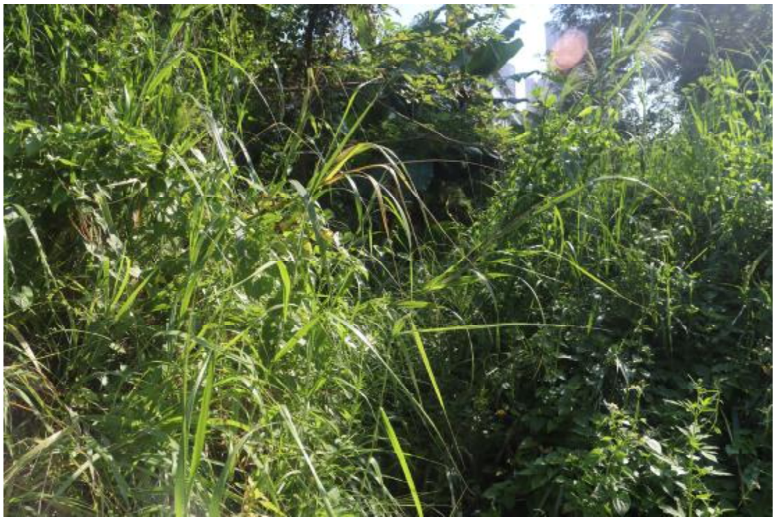
图 25 地块内现状（西南-东北）