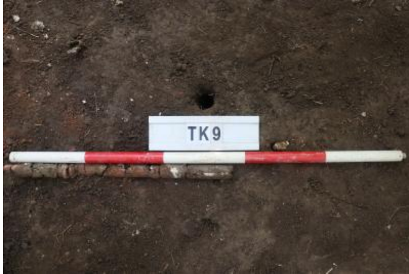
图 38 TK9 土样（一米标杆，土样由左往右）

①层：垫土层，距地表深 0-0.58 米，厚 0.58 米，为灰褐色黏土，土质较疏松，内含植物根系、红砖碎块及石子等。以下遇大石块阻拦，无法提取土样。