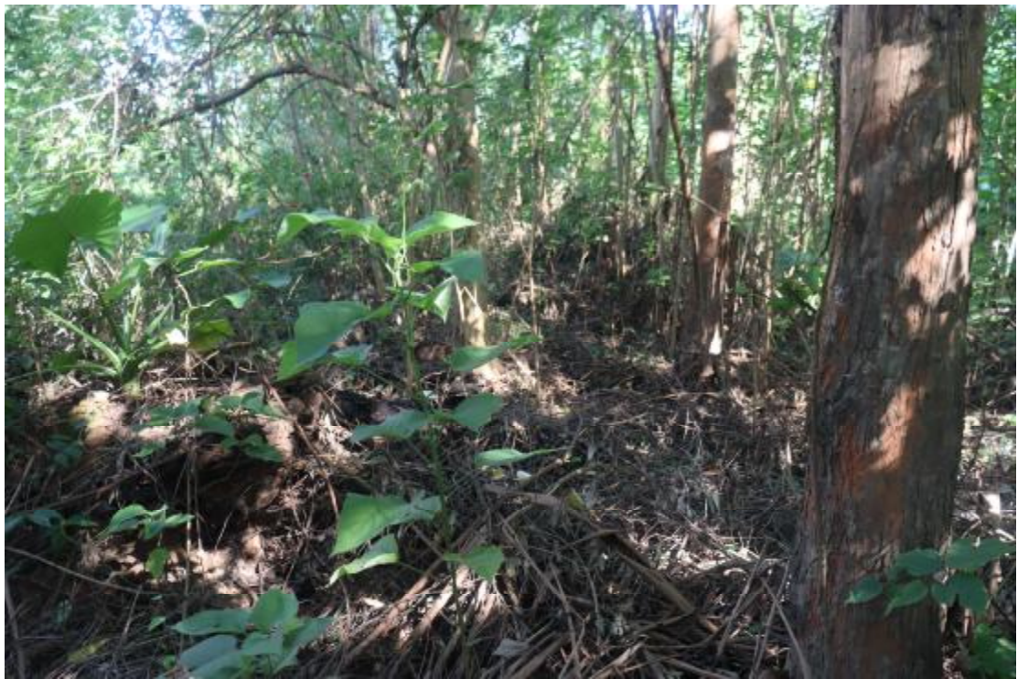
图 15 地块内现状（东南-西北）