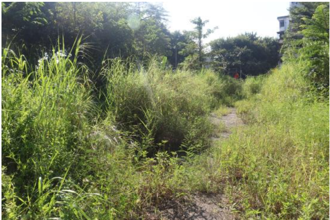
图 21 地块内现状（西北-东南）