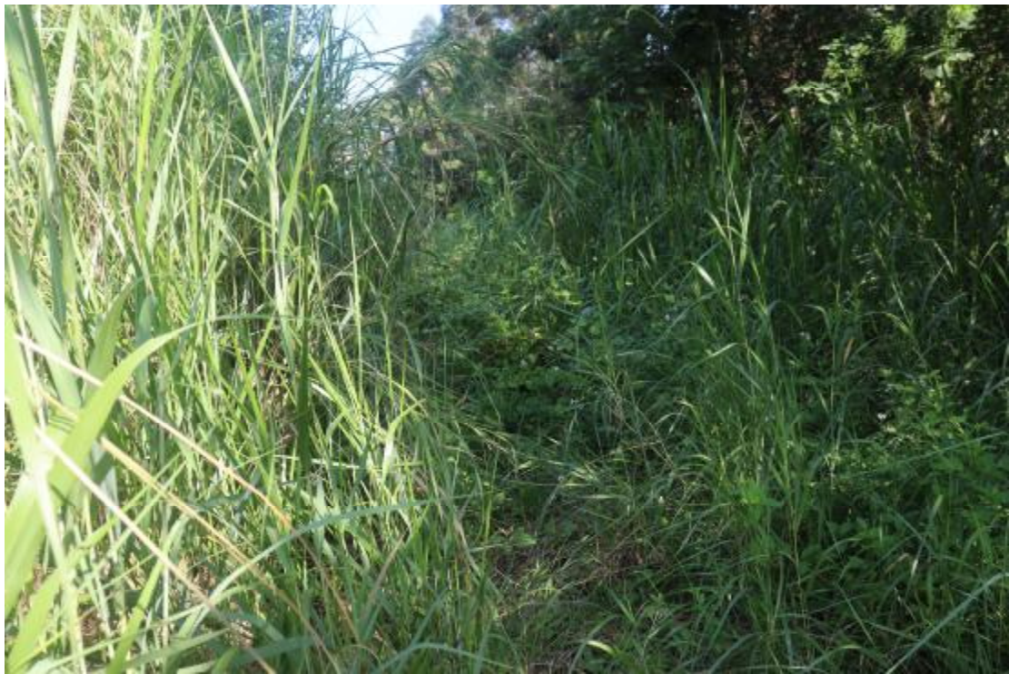
图 17 地块内现状（东南-西北）