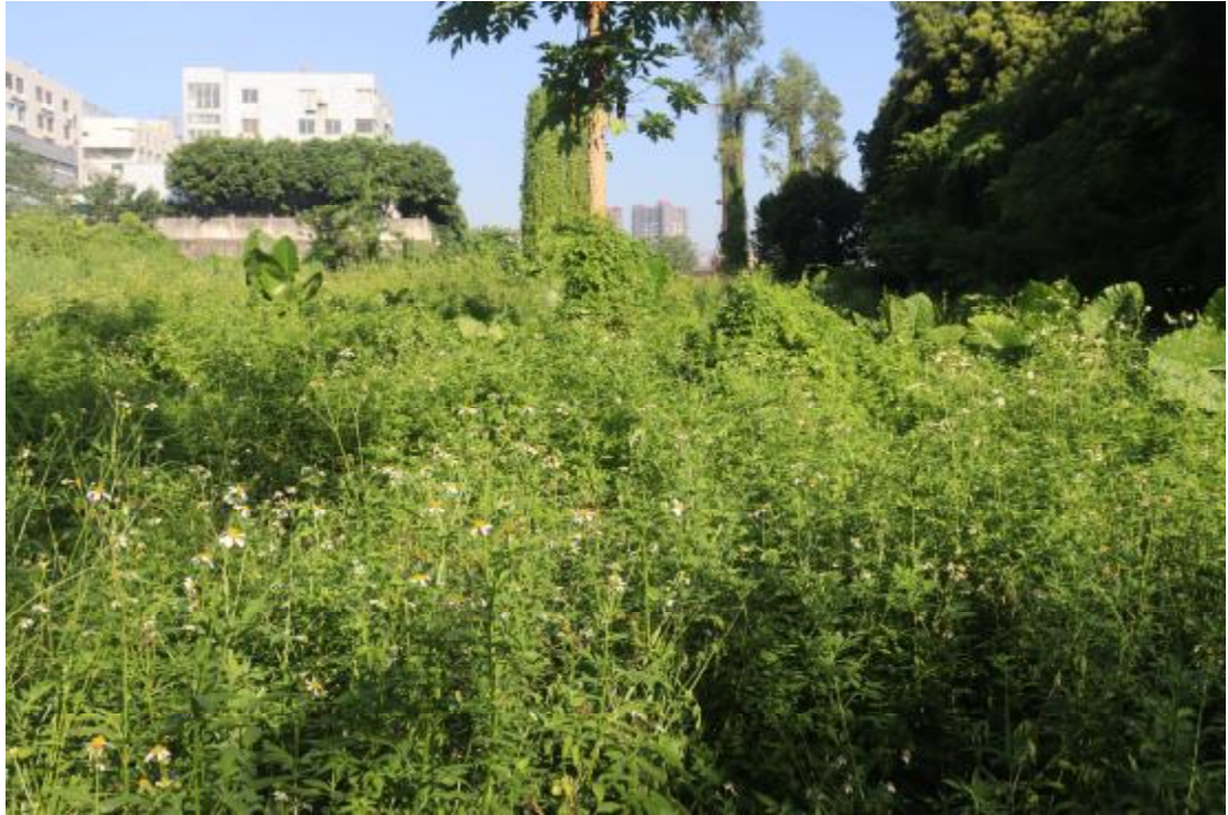
图 18 地块内现状（东南-西北）