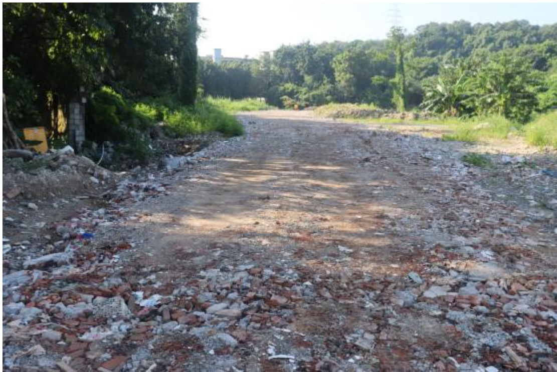
图 9 地块内现状（北-南）