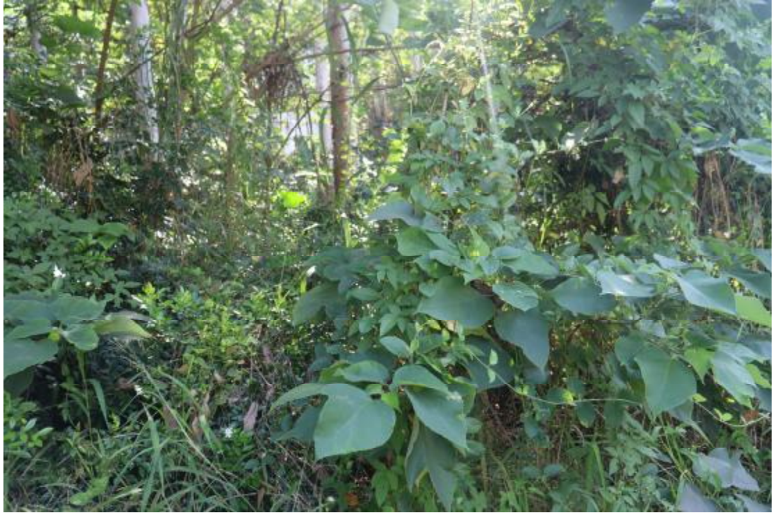
图 20 地块内现状（西北-东南）