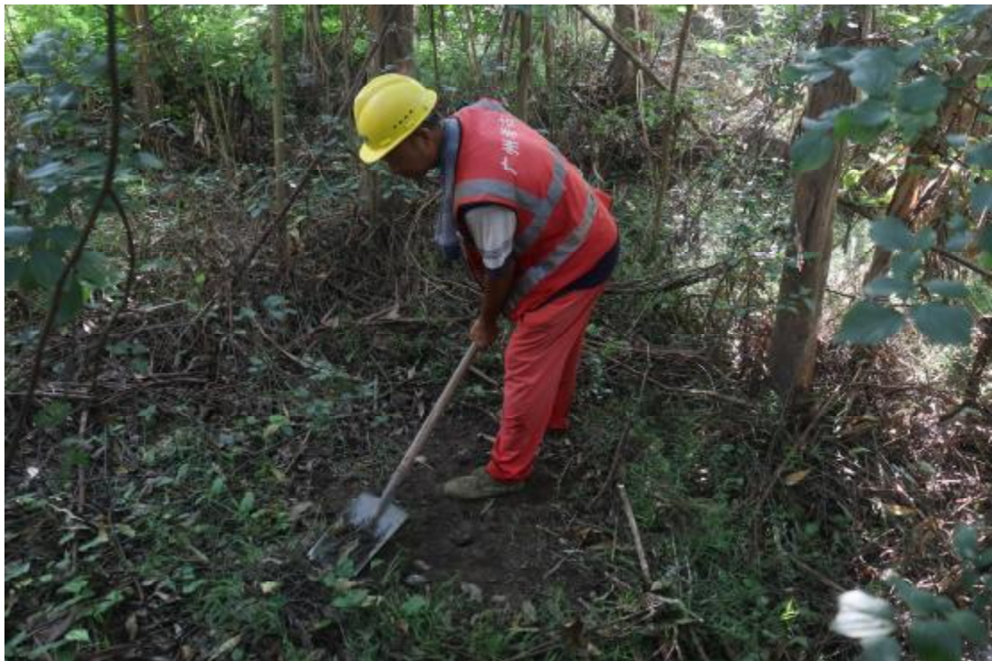
图 27 地表清理（西北-东南）