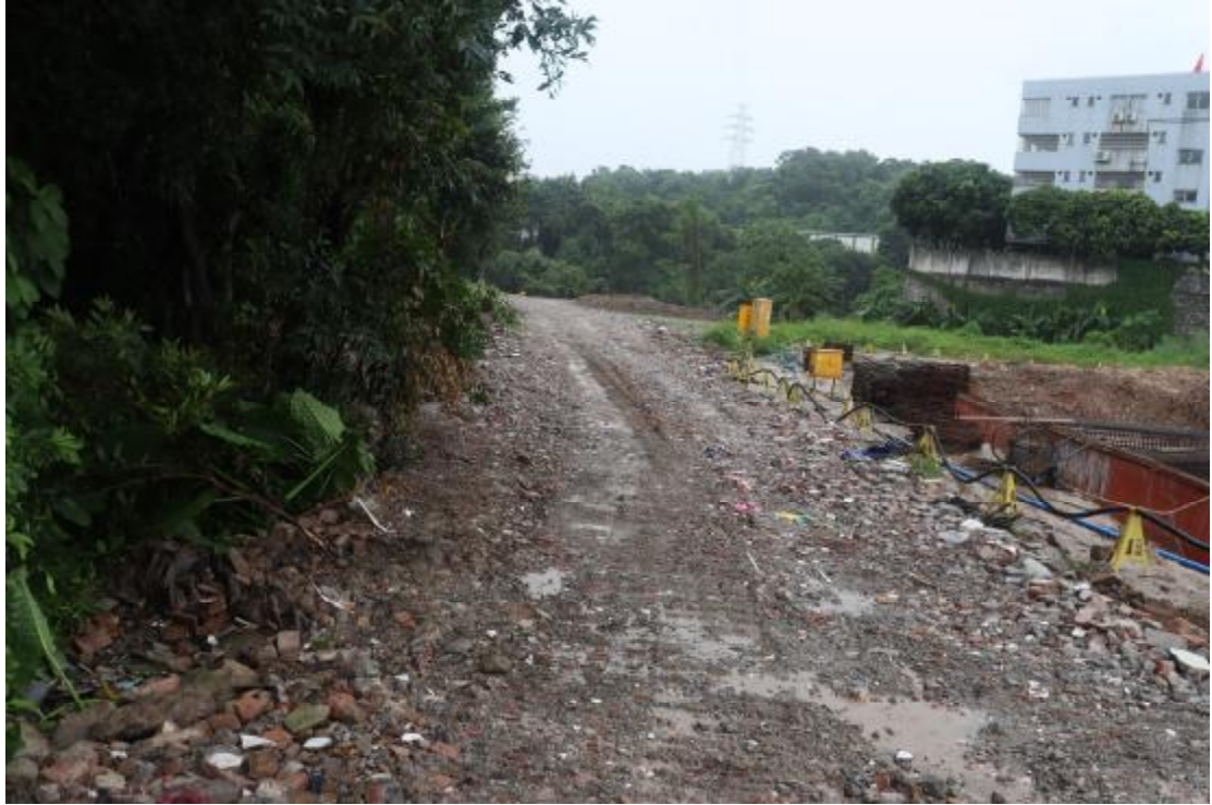
图 10 地块内现状（北-南）