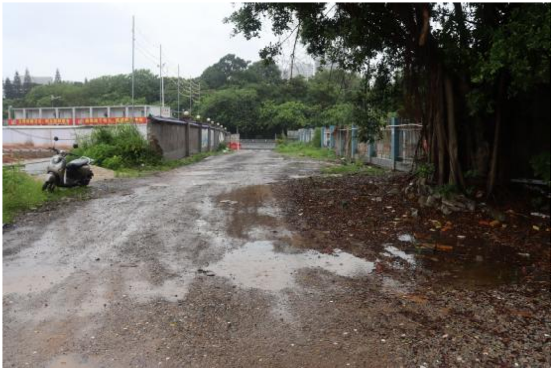
图 7 地块内现状（南-北）