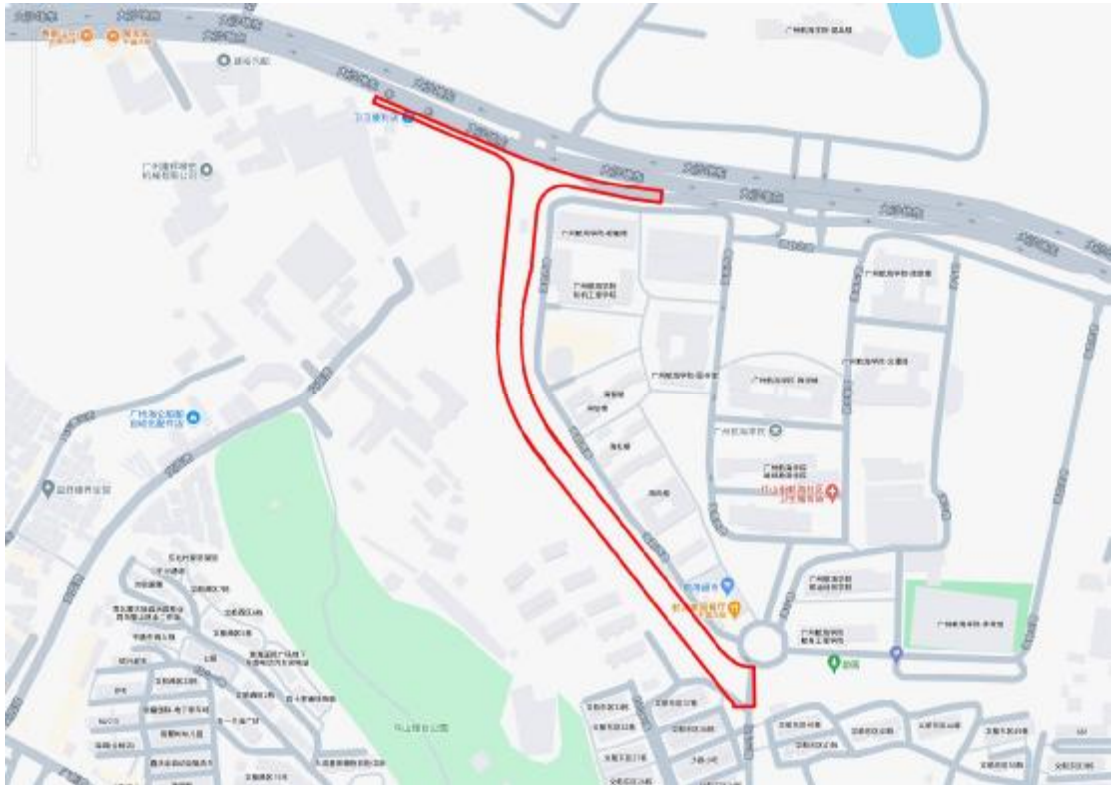
图 3 项目地块周边环境示意图（奥维地图）