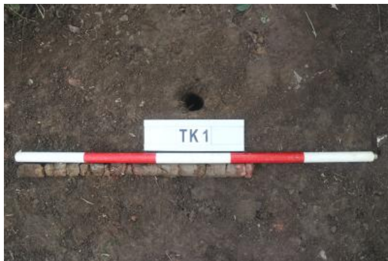
图 30 TK1 土样（一米标杆，土样由左往右）

①层：垫土层，距地表深 0-0.6 米，厚 0.6 米，为灰褐色黏土，土质较疏松，内含植物根系、红砖碎块及石子等。以下为红褐色黏土，土质致密、纯净，系生土。