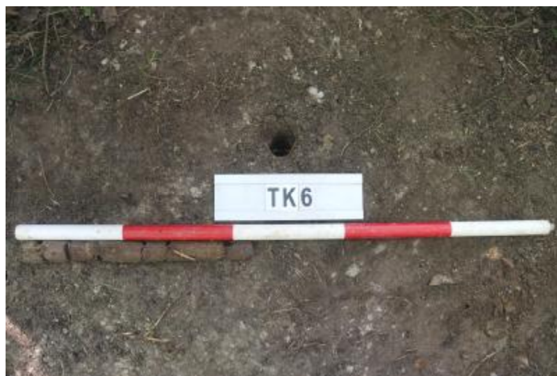
图 35 TK6 土样（一米标杆，土样由左往右）

①层：垫土层，距地表深 0-0.38 米，厚 0.38 米，为灰褐色黏土，土质较疏松，内含植物根系、红砖碎块及石子等。以下为红褐色黏土，土质致密、纯净，系生土。