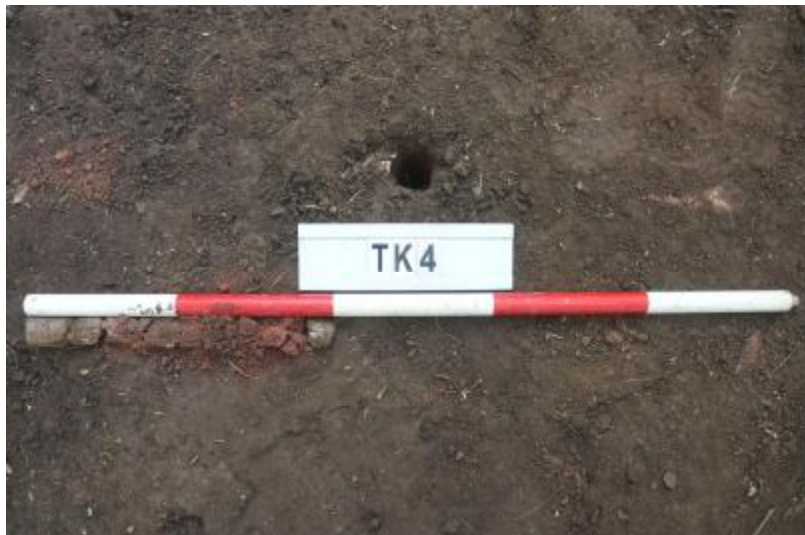
图 33 TK4 土样（一米标杆，土样由左往右）

①层：垫土层，距地表深 0-0.4 米，厚 0.4 米，为灰褐色黏土，土质较疏松，内含植物根系、红砖碎块及石子等。以下遇大石块阻拦，无法提取土样。