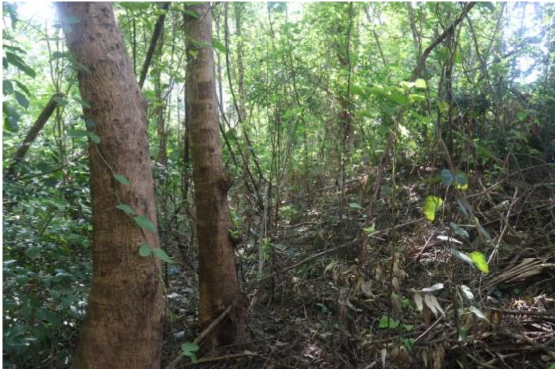
图 23 地块内现状（西北-东南）