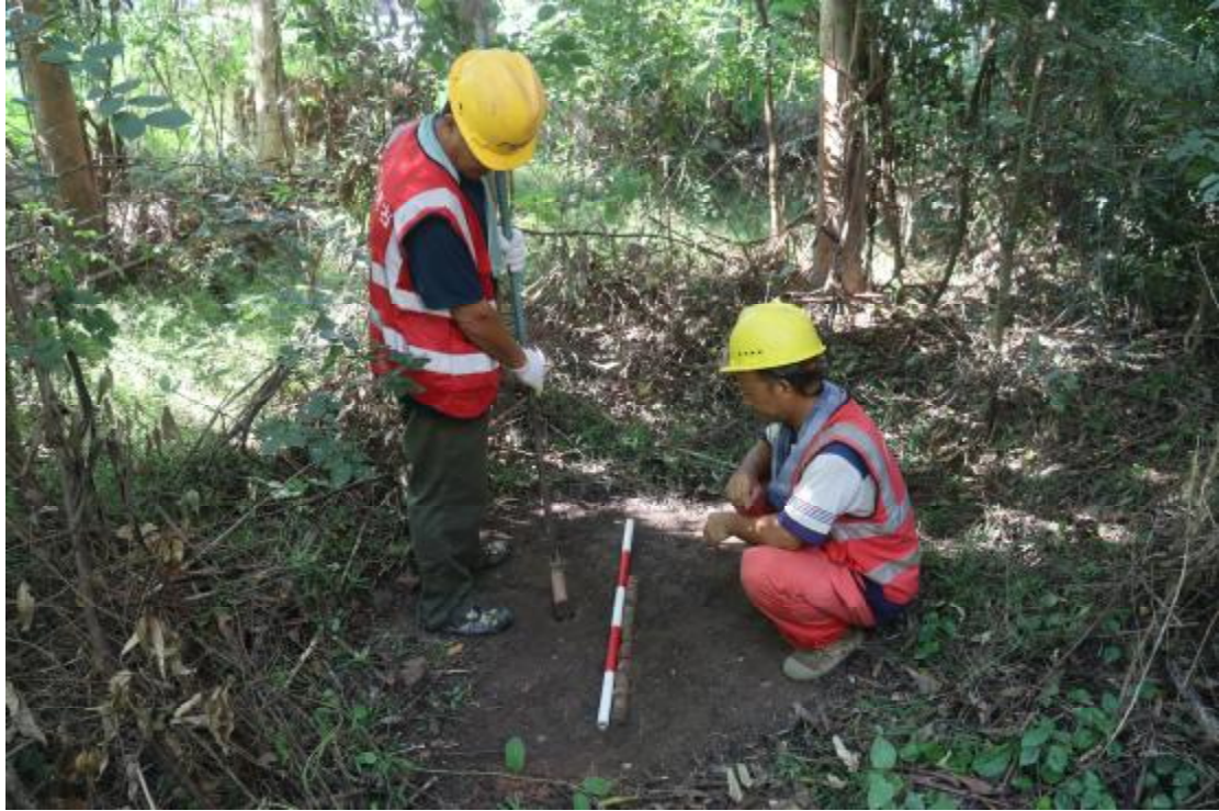
图 28 土样提取（北-南）