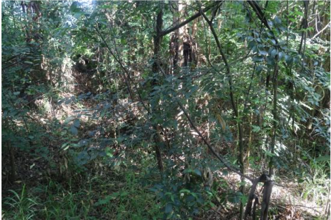
图 14 地块内现状（东南-西北）