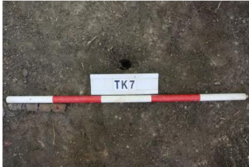
图 36 TK7 土样（一米标杆，土样由左往右）

①层：垫土层，距地表深 0-0.25 米，厚 0.25 米，为灰褐色黏土，土质较疏松，内含植物根系、红砖碎块及石子等。以下遇大石块阻拦，无法提取土样。