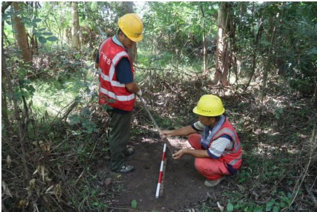
图 29 土样分析（北-南）