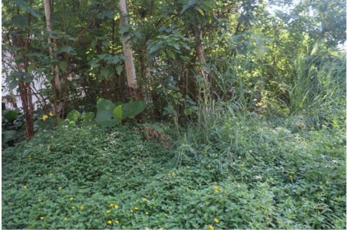
图 22 地块内现状（西北-东南）