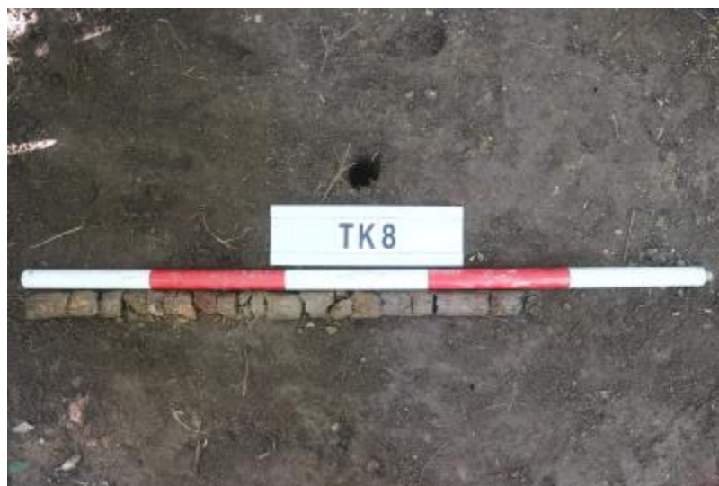
图 37 TK8 土样（一米标杆，土样由左往右）

①层：垫土层，距地表深 0-0.4 米，厚 0.4 米，为灰褐色黏土，土质较疏松，内含植物根系、红砖碎块及石子等。以下为红褐色黏土，土质致密、纯净，系生土。