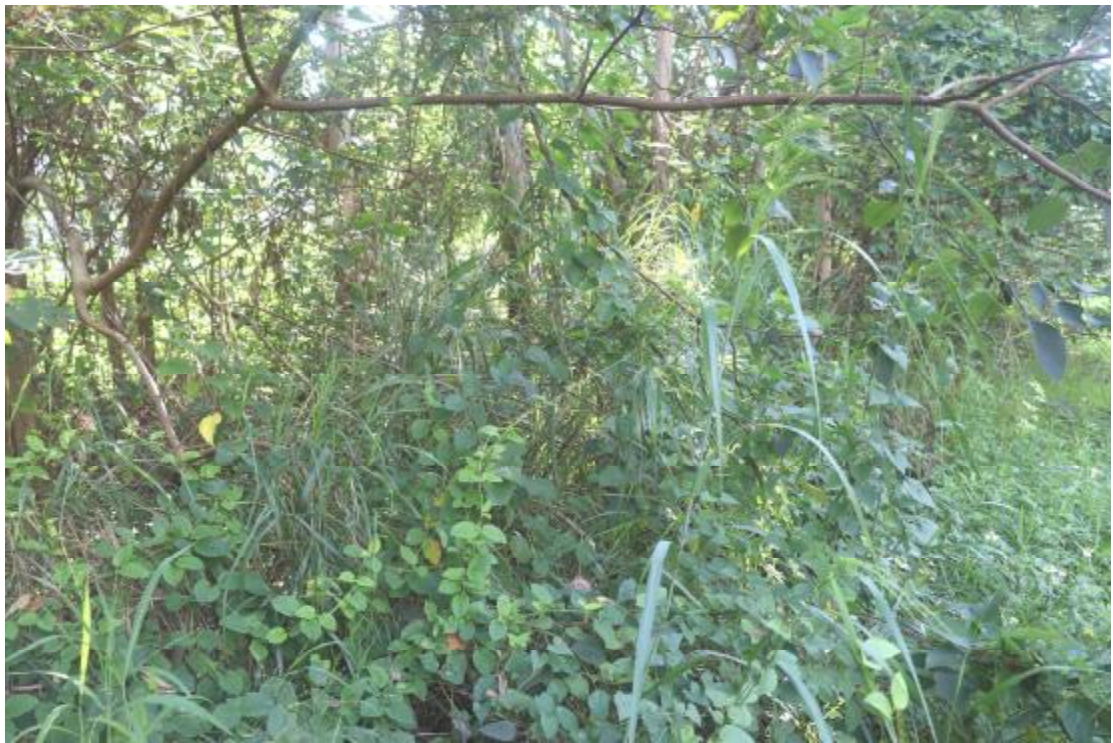
图 19 地块内现状（西北-东南）