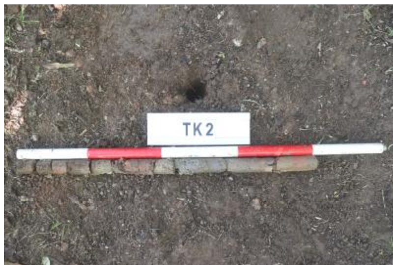
图 31 TK2 土样（一米标杆，土样由左往右）

①层：垫土层，距地表深 0-0.7 米，厚 0.7 米，为灰褐色黏土，土质较疏松，内含植物根系、红砖碎块及石子等。以下为红褐色黏土，土质致密、纯净，系生土。