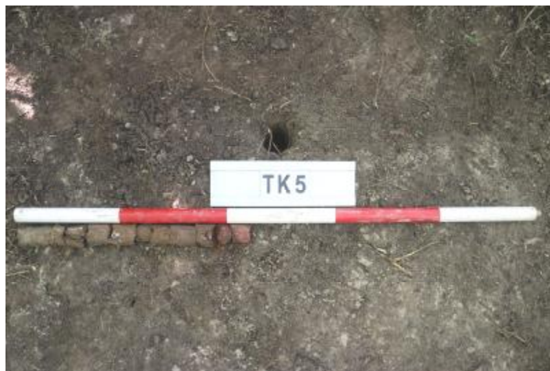
图 34 TK5 土样（一米标杆，土样由左往右）

①层：垫土层，距地表深 0-0.4 米，厚 0.4 米，为灰褐色黏土，土质较疏松，内含植物根系、红砖碎块及石子等。以下为红褐色黏土，土质致密、纯净，系生土。