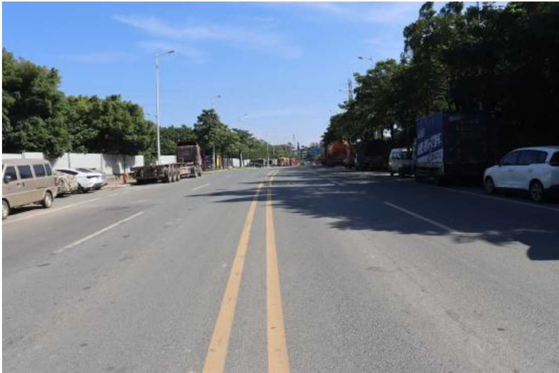
图 21 地块内现状（西南-东北）