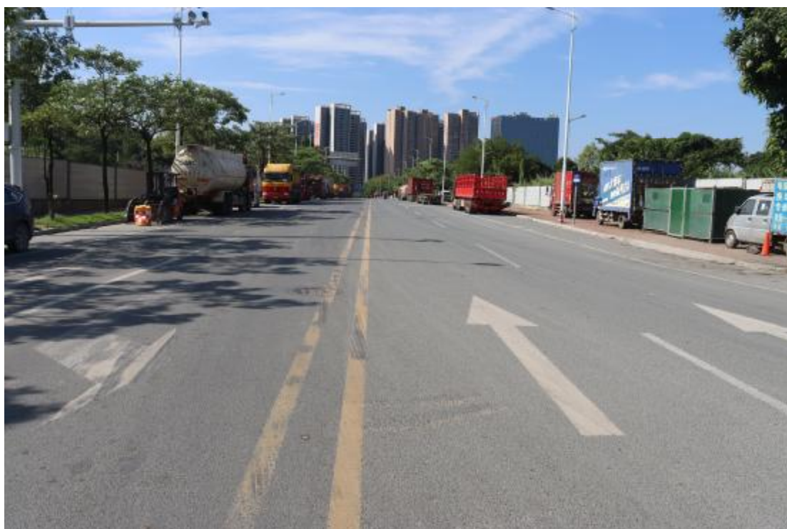
图 7 地块内现状（东北-西南）