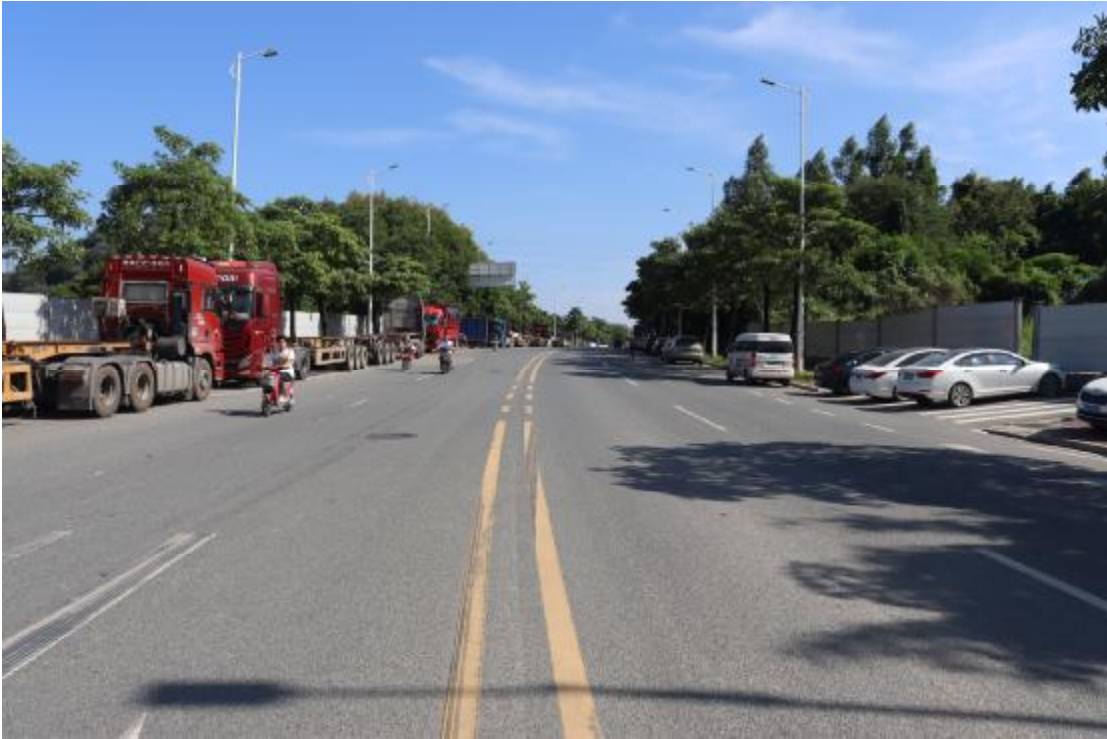
图 16 地块内现状（西-东）