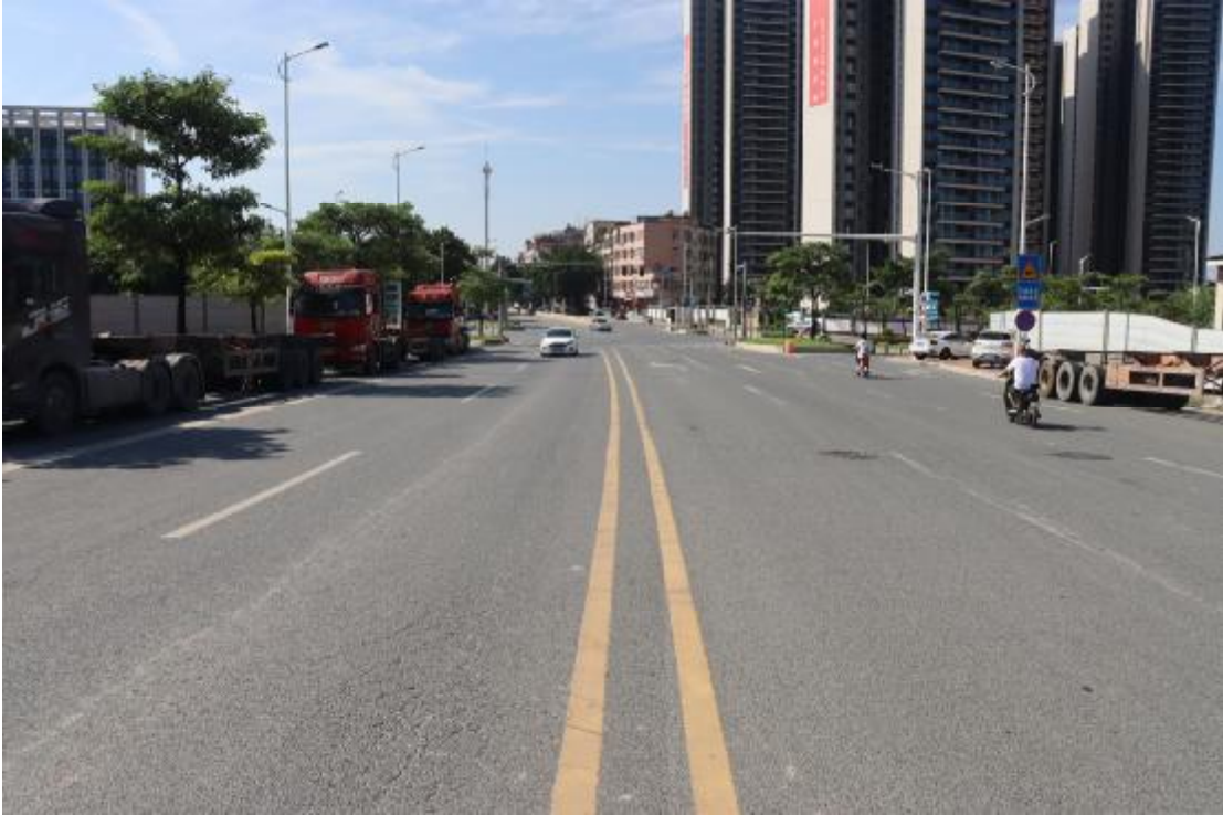
图 10 地块内现状（东北-西南）