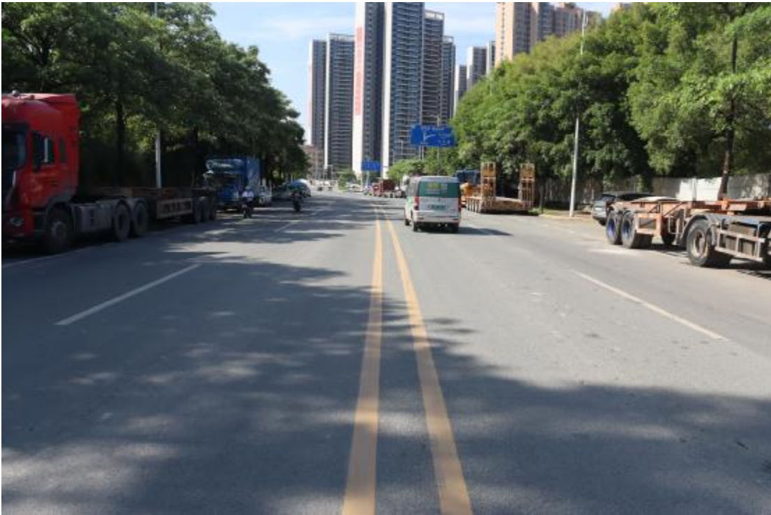
图 9 地块内现状（东北-西南）