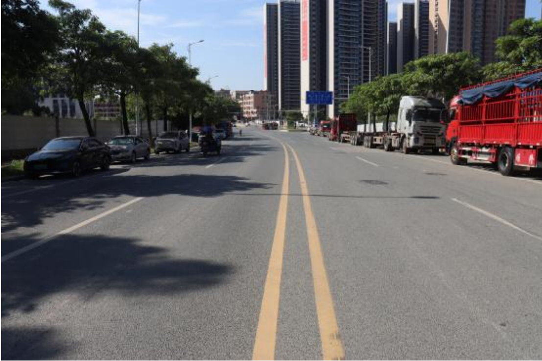
图 14 地块内现状（南-北）