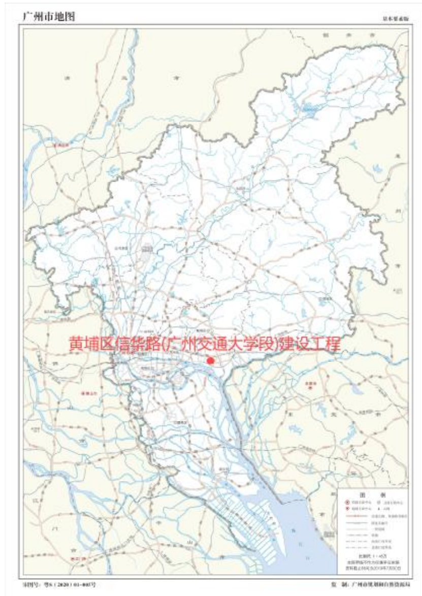
图 1 项目工程在广州市位置示意图（广州市规划和自然资源局）

根据《中华人民共和国文物保护法》《广州市文物保护规定》，按照《广州市文物局关于黄埔区新龙镇大埔路（西段）市政道路及配套工程等项目考古调查勘探工作的复函》（文物 20240912 号）指导意见，受广州开发区财政投资建设项目管理中心委托，由我院负责该项目工程的考古调查工作。