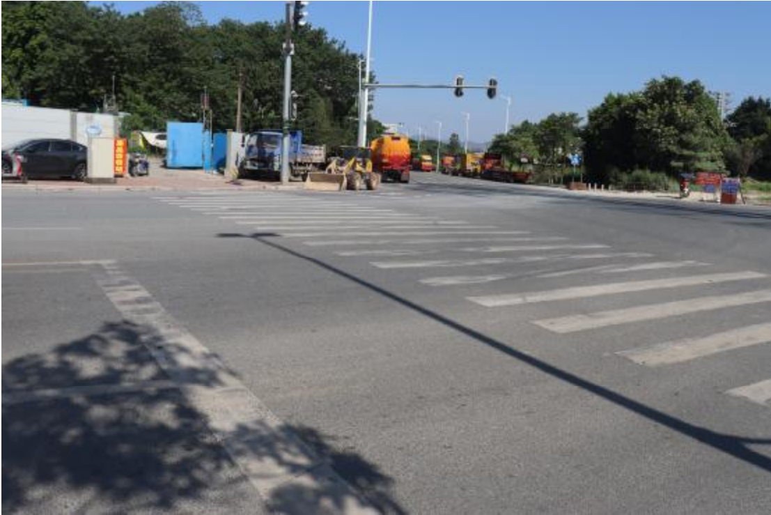
图 12 地块内现状（东南-西北）