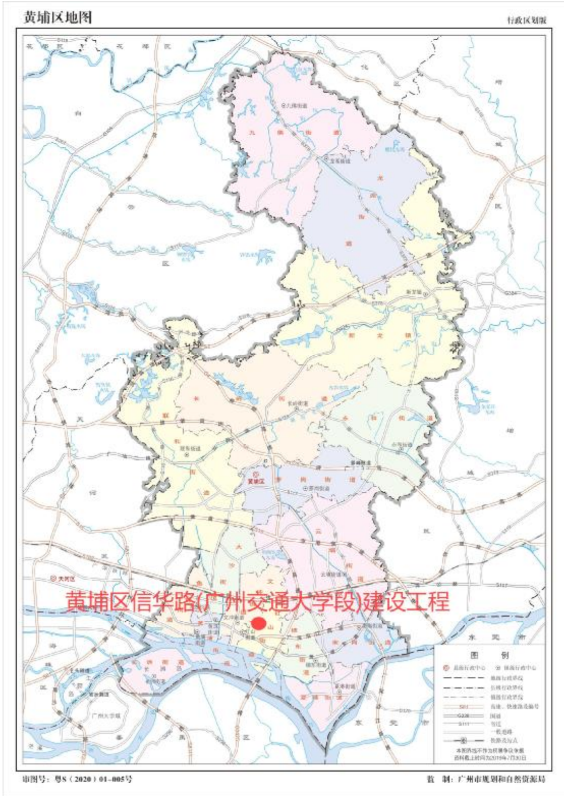
图 2 项目工程在黄埔区位置示意图（广州市规划和自然资源局）