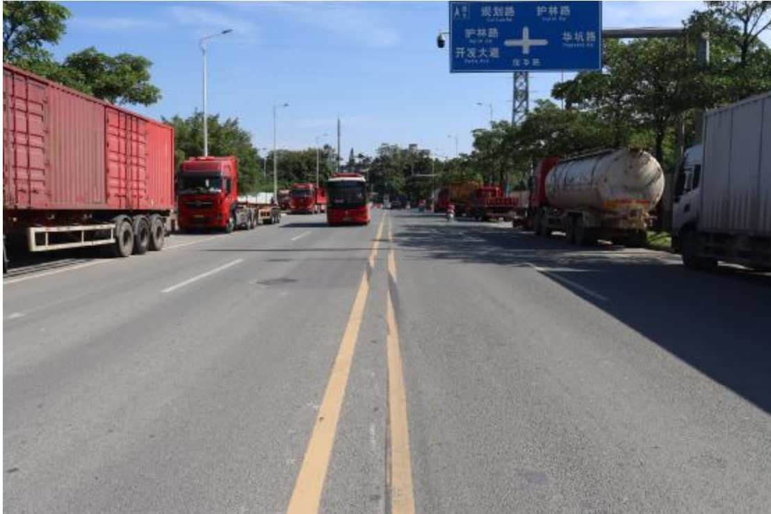
图 20 地块内现状（西南-东北）