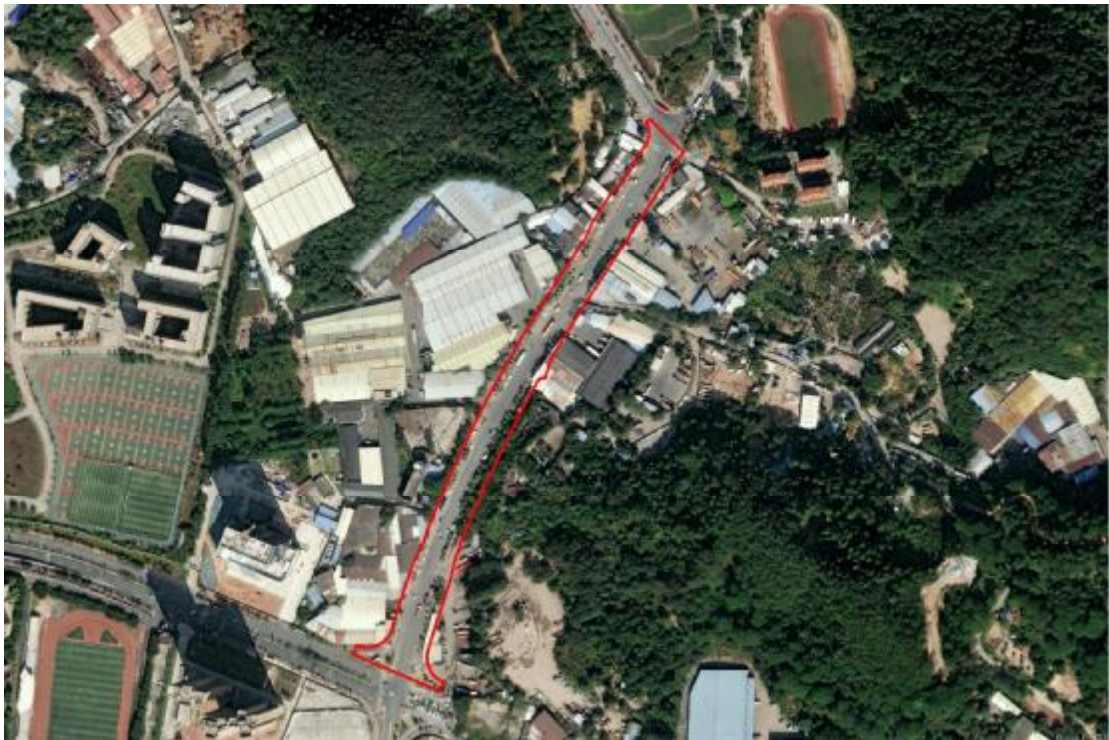
图 4 项目工程卫星红线图（奥维地图）