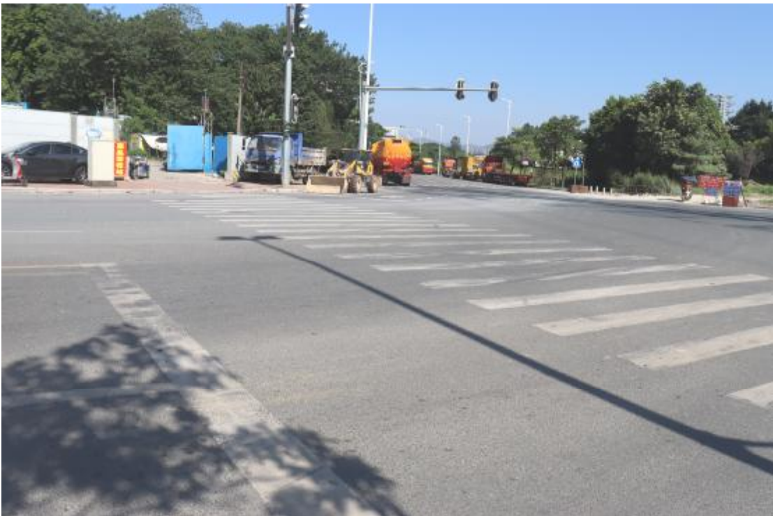
图 13 地块内现状（东南-西北）