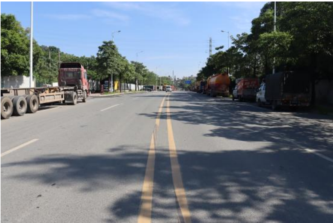
图 19 地块内现状（西南-东北）