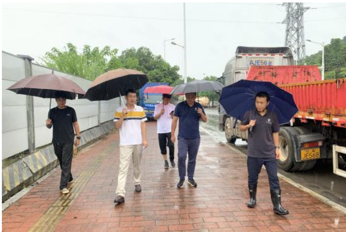
图 6 现场踏查（西南-东北）