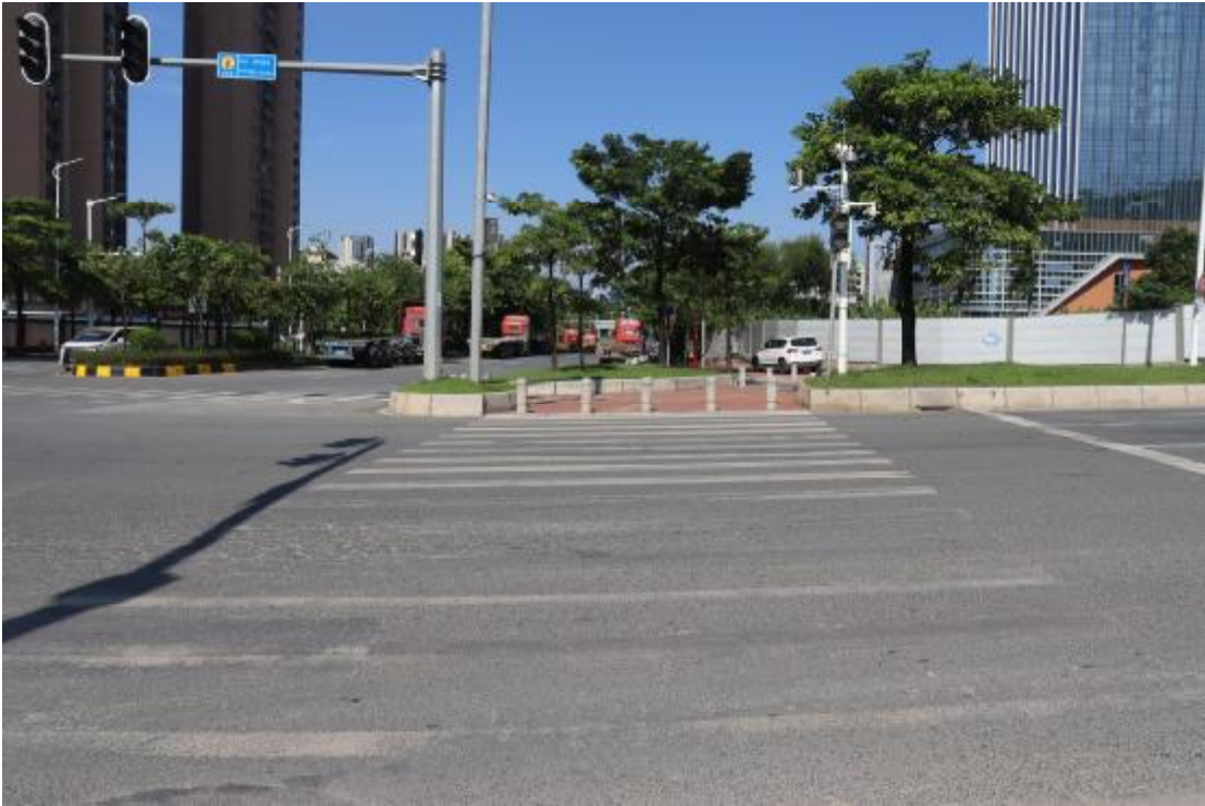
图 11 地块内现状（东南-西北）