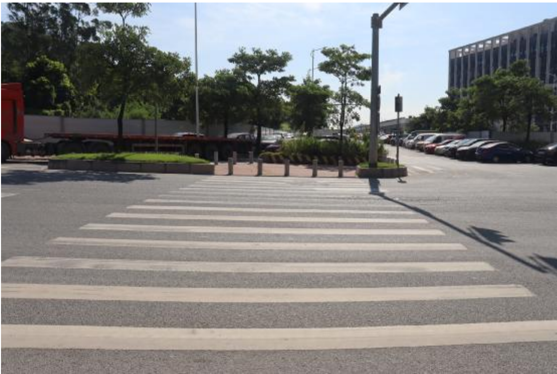
图 17 地块内现状（西北-东南）