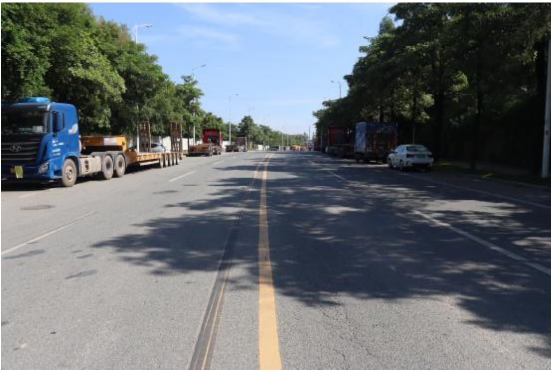
图 15 地块内现状（南-北）