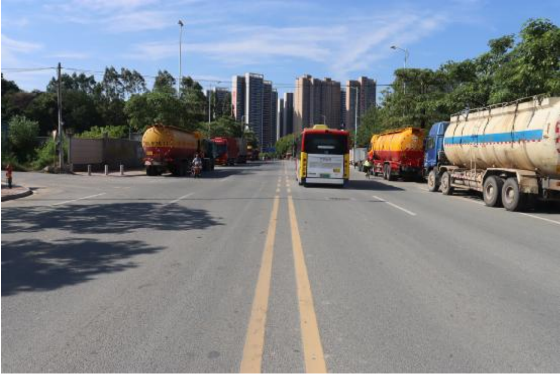
图 8 地块内现状（东北-西南）