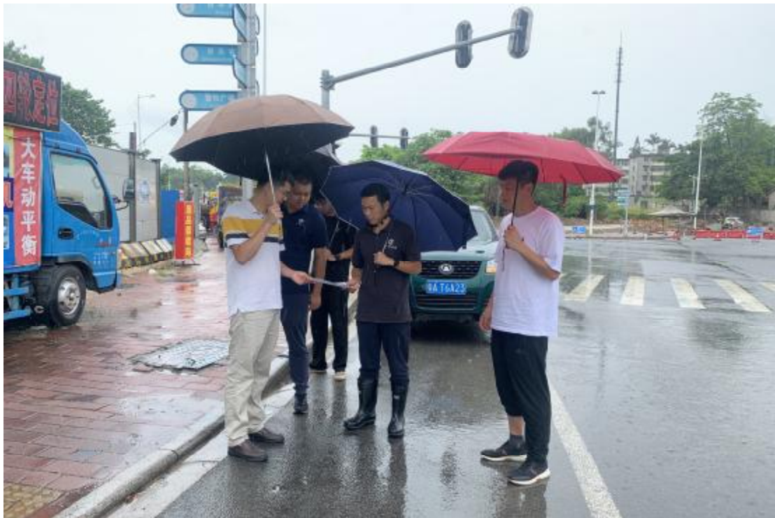
图 5 工作人员确认地块范围(南-北)