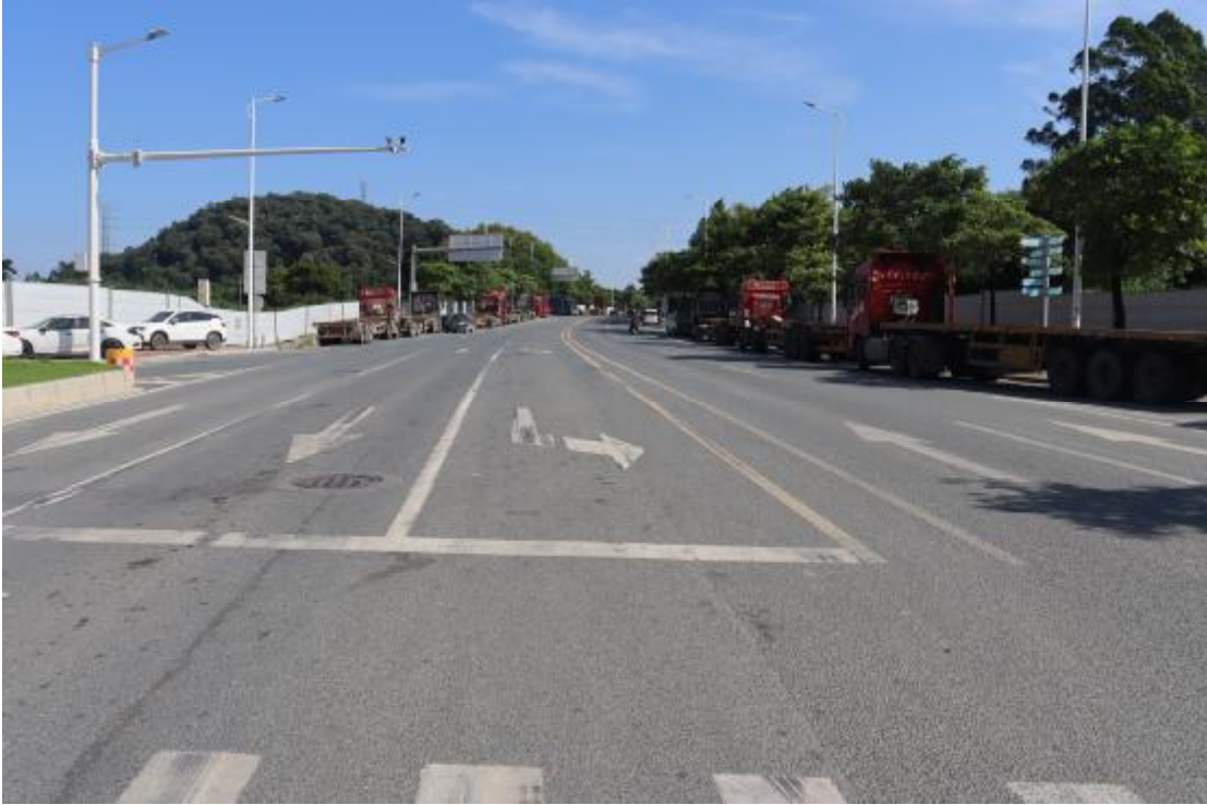
图 18 地块内现状（西南-东北）