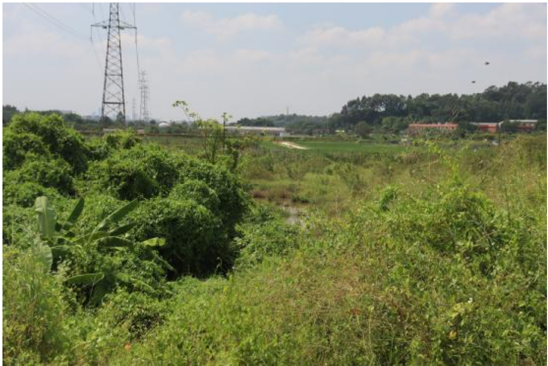
图 17 横二路地块内现状（东北-西南）