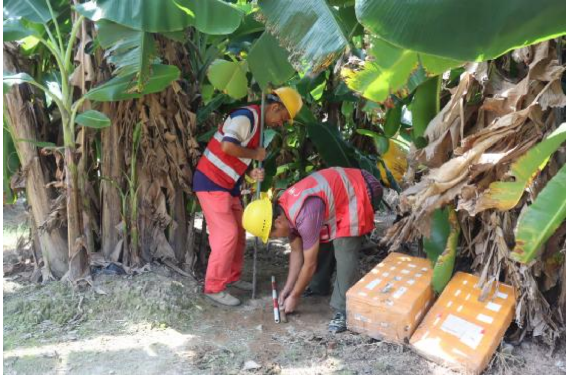
图 28 土样提取（东北-西南）