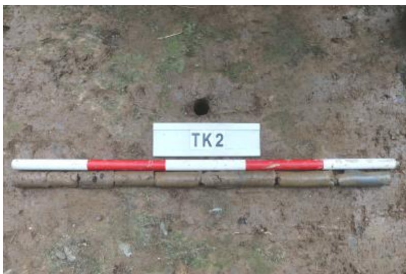
图 31 TK2 土样 (一米标杆, 土样由左往右)

②层: 淤积层, 距地表深 0.83-0.98 米, 厚 0.15 米, 为灰黑色淤泥, 土质较疏松, 内含石子等。以下渗水严重, 无法提取土样。