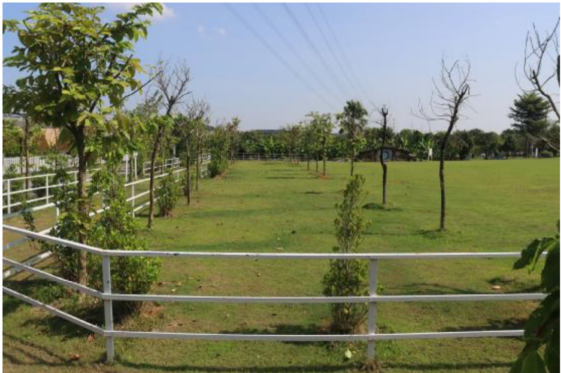
图 15 横二路地块内现状（西南-东北）