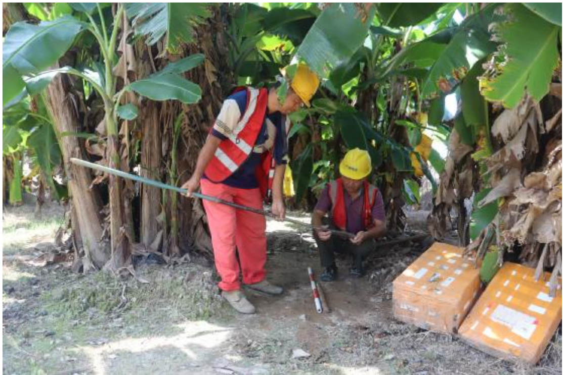
图 29 土样分析（东北-西南）