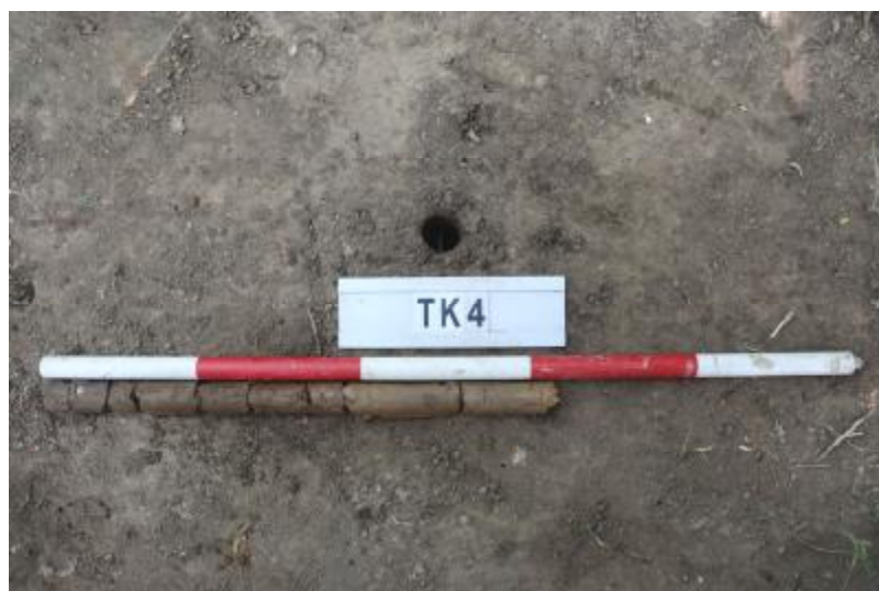
图 33 TK4 土样 (一米标杆, 土样由左往右)

①层: 垫土层, 距地表深 0-0.38 米, 厚 0.38 米, 为灰褐色黏土, 土质较疏松, 内含植物根系、建筑垃圾等。以下为红褐色黏土, 土质致密、纯净, 系生土。