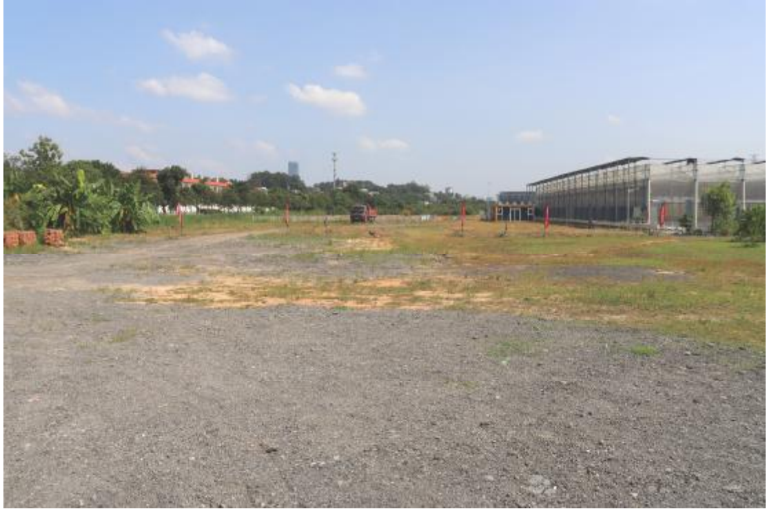
图 12 横一路地块内现状（西南-东北）