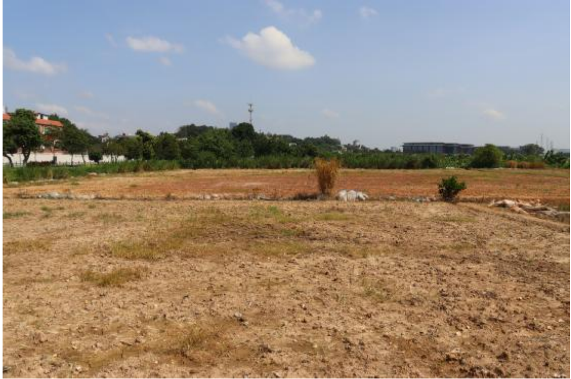
图 10 横一路地块内现状（西南-东北）