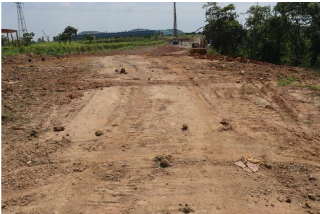
图 23 纵二路地块内现状（西北-东南）