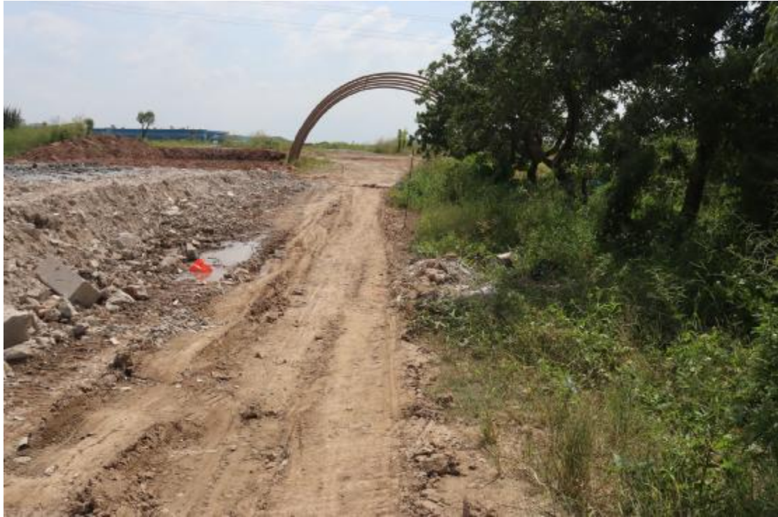
图 24 纵二路地块内现状（西北-东南）