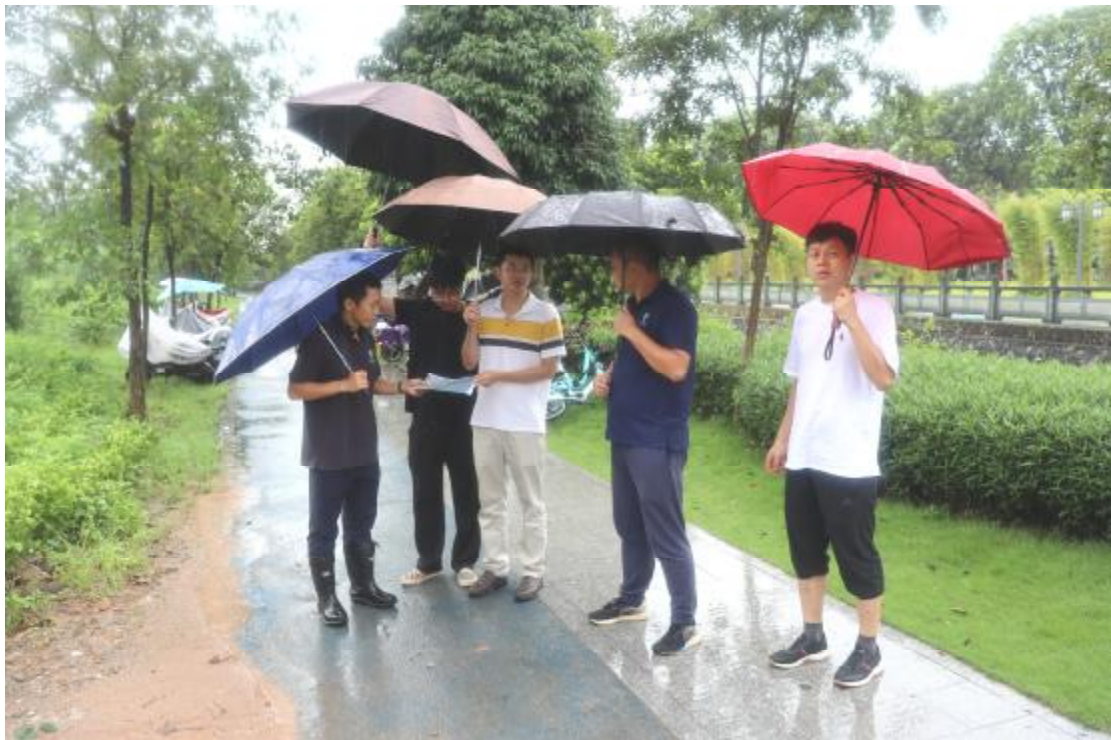
图 5 工作人员确认地块范围（东-西）