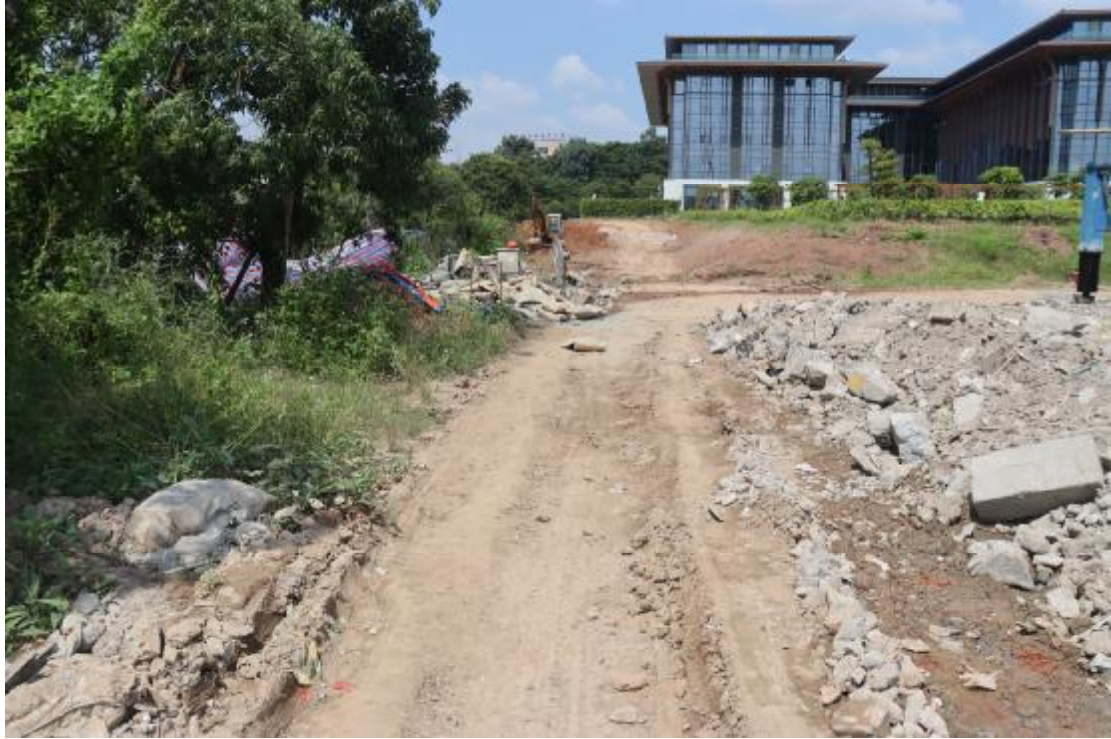
图 22 纵二路地块内现状（东南-西北）