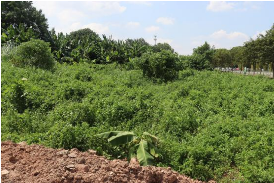
图 9 横一路地块内现状（东北-西南）