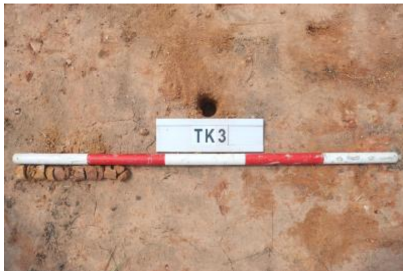
图 32 TK3 土样 (一米标杆, 土样由左往右)

①层: 垫土层, 距地表深 0-0.1 米, 厚 0.1 米, 为灰褐色黏土, 土质较疏松, 内含植物根系、建筑垃圾等。以下为红褐色风化土, 土质致密、纯净, 系生土。