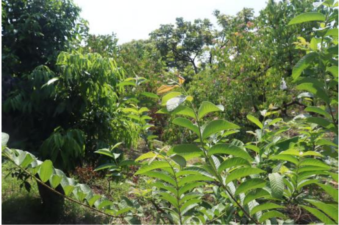
图 20 纵一路地块内现状（西北-东南）