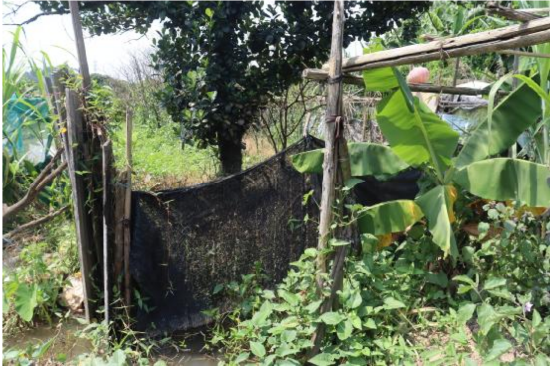
图 8 横一路地块内现状（东北-西南）