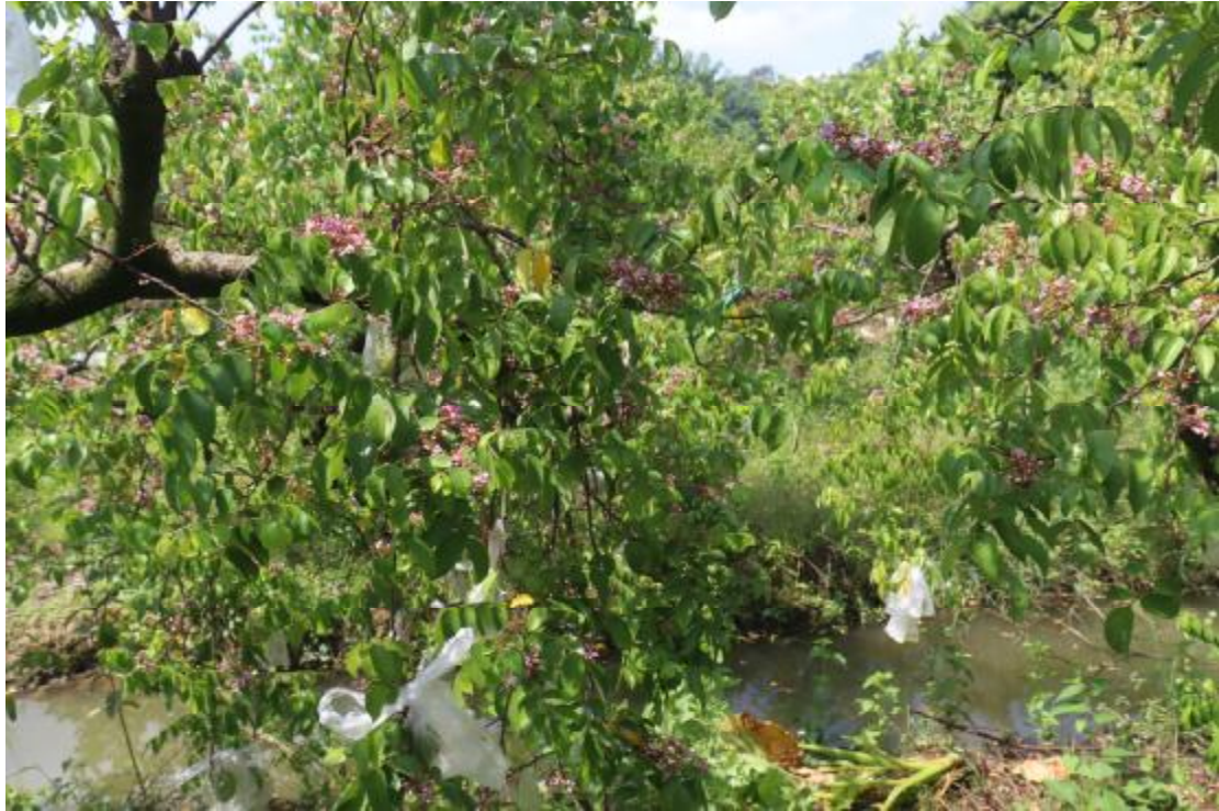
图 18 纵一路地块内现状（东南-西北）