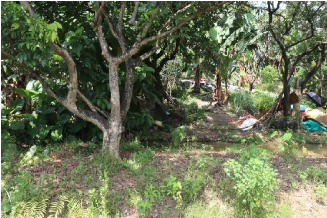
图 7 横一路地块内现状（东北-西南）