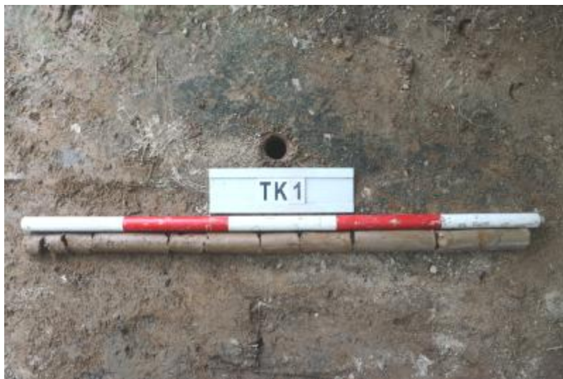
图 30 TK1 土样 (一米标杆, 土样由左往右)

①层: 垫土层, 距地表深 0-0.37 米, 厚 0.37 米, 为灰褐色黏土, 土质较疏松, 内含植物根系、建筑垃圾等。以下为红褐色黏土, 土质致密、纯净, 系生土。