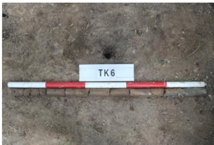
图 35 TK6 土样（一米标杆，土样由左往右）

②层：淤积层，距地表深 0.8-1 米，厚 0.2 米，为灰黑色淤泥，土质较疏松，内含石子等。以下渗水严重，无法提取土样。