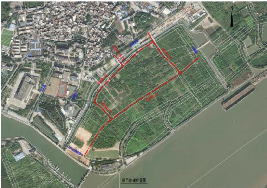
图 4 项目工程卫星红线图(建设单位提供)