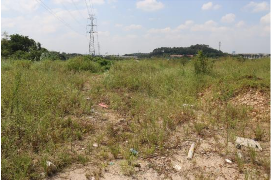
图 16 横二路地块内现状（东北-西南）