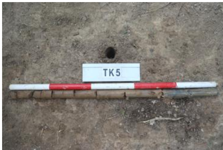
图 34 TK5 土样（一米标杆，土样由左往右）

②层：淤积层，距地表深 0.73-1 米，厚 0.27 米，为灰黑色淤泥，土质较疏松，内含石子等。以下渗水严重，无法提取土样。