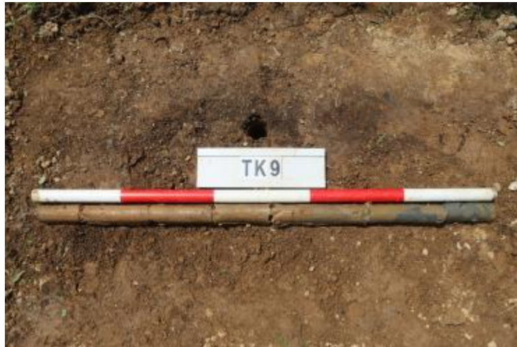
图 38 TK9 土样 (一米标杆,土样由左往右)

②层: 淤积层,距地表深 0.8-1 米,厚 0.2 米,为灰黑色淤泥,土质较疏松,内含石子等。以下渗水严重,无法提取土样。