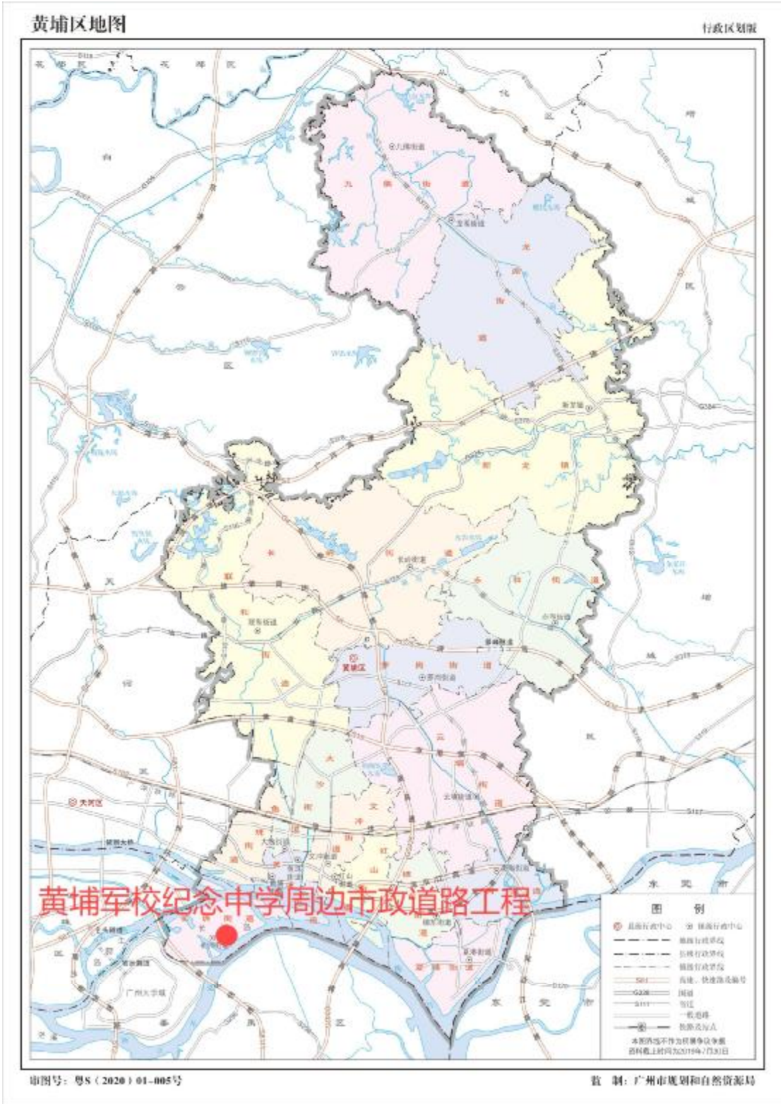
图 2 项目工程在黄埔区位置示意图（广州市规划和自然资源局）