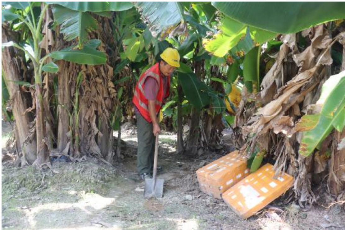
图 27 地表清理（东北-西南）