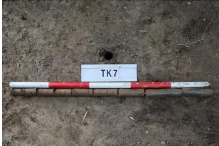
图 36 TK7 土样 (一米标杆, 土样由左往右)

②层: 淤积层, 距地表深 0.7-1 米, 厚 0.3 米, 为灰黑色淤泥, 土质较疏松, 内含石子等。以下渗水严重, 无法提取土样。