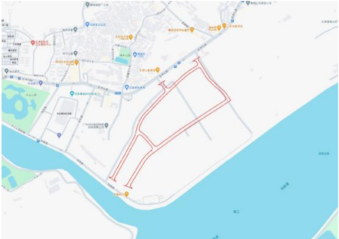
图 3 项目工程周边环境示意图（奥维地图）