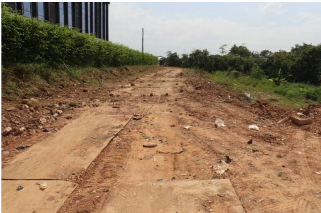
图 25 纵二路地块内现状（西北-东南）