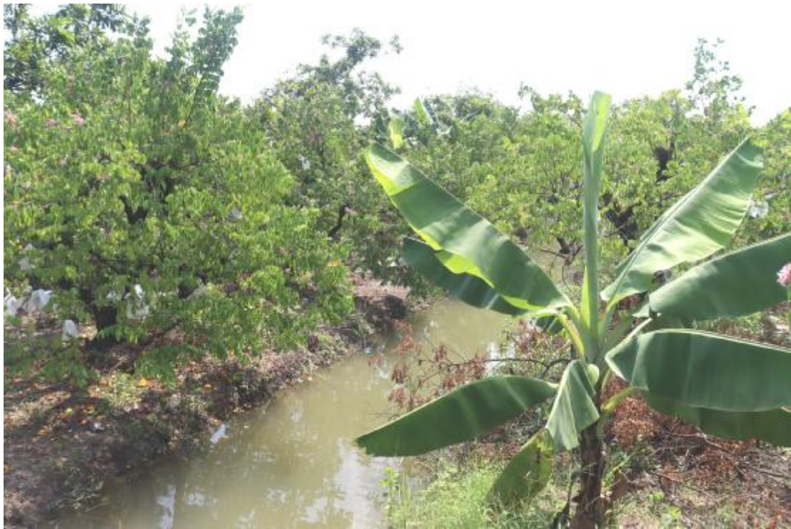
图 19 纵一路地块内现状（西北-东南）