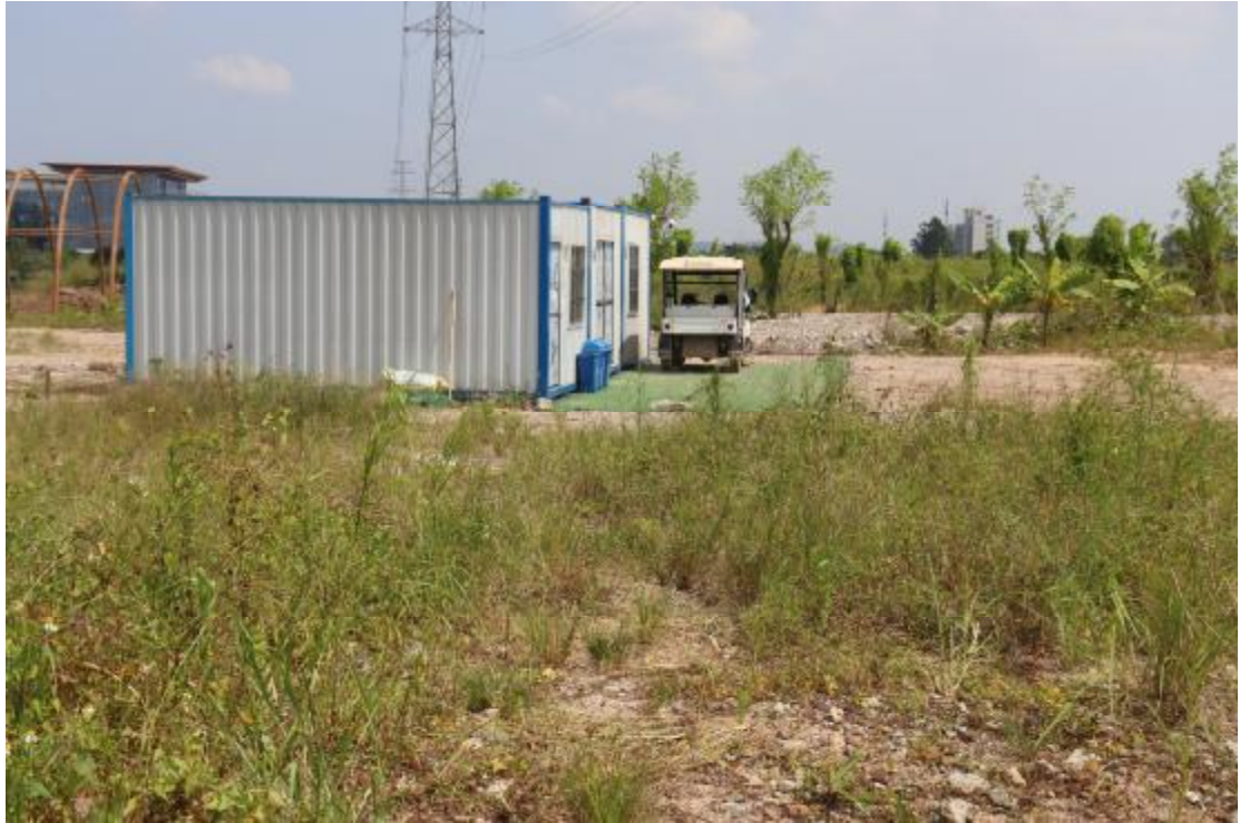
图 14 横二路地块内现状（西南-东北）