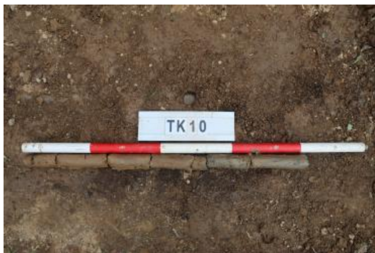
图 39 TK10 土样 (一米标杆,土样由左往右)

②层: 淤积层,距地表深 0.53-1 米,厚 0.47 米,为灰黑色淤泥,土质较疏松,内含石子等。以下渗水严重,无法提取土样。