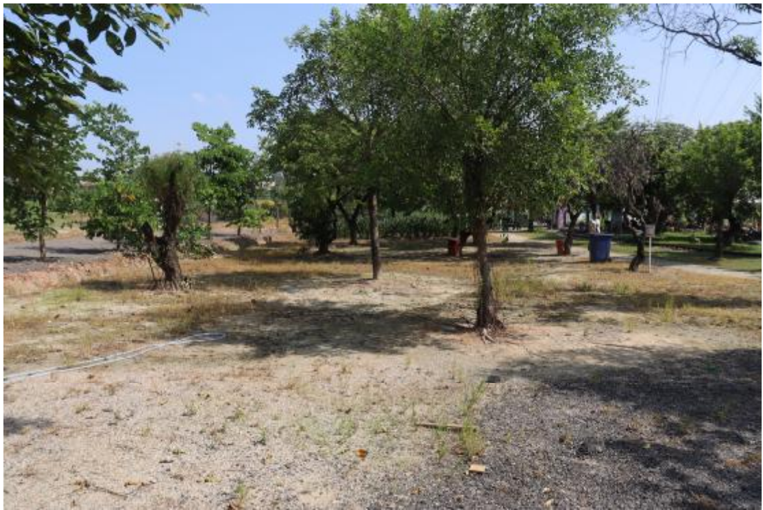
图 13 横二路地块内现状（西南-东北）