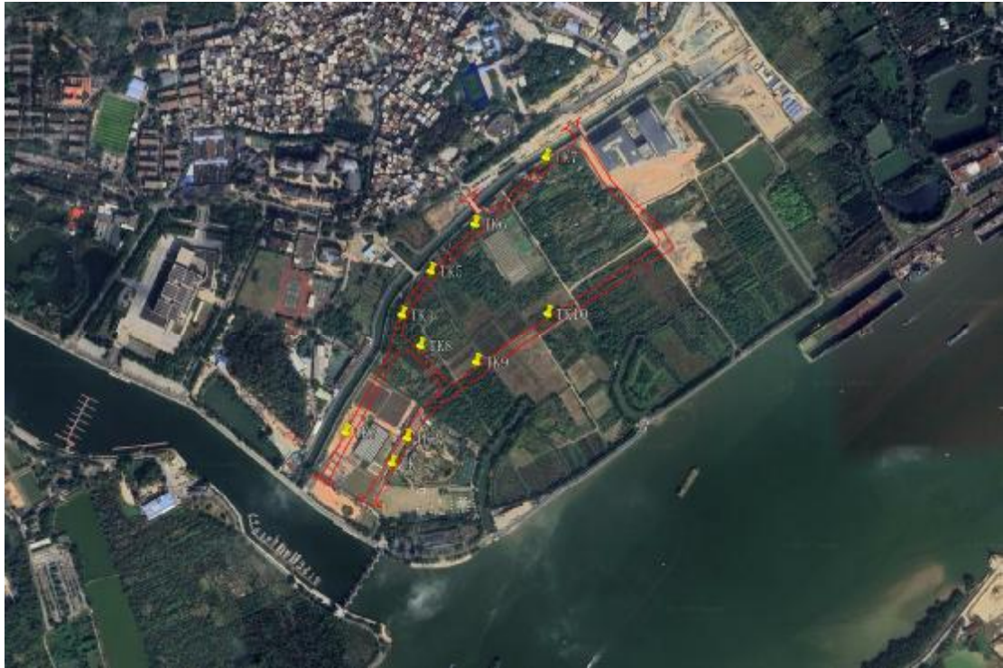
图 26 标准型探孔位置分布图（黄色标记点）

为进一步了解并掌握该项目工程内地层堆积情况，我们在工程范围内进行了试探。提取 10 个标准型探孔，编号为 TK1-TK10，具体情况如下：