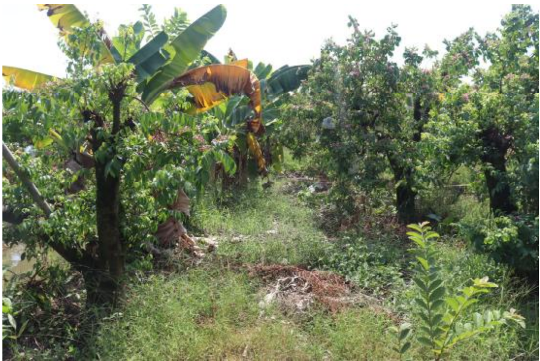
图 21 纵一路地块内现状（西北-东南）