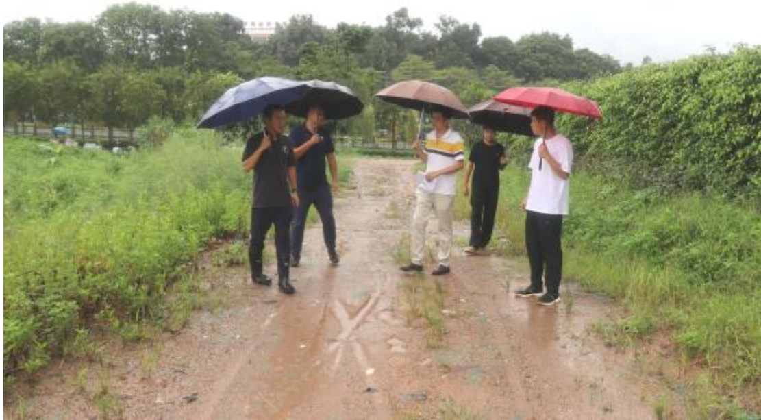
图 6 现场踏查（东南-西北）