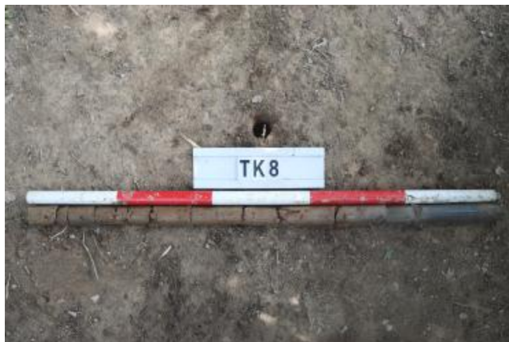
图 37 TK8 土样 (一米标杆, 土样由左往右)

②层: 淤积层, 距地表深 0.7-1 米, 厚 0.3 米, 为灰黑色淤泥, 土质较疏松, 内含石子等。以下渗水严重, 无法提取土样。