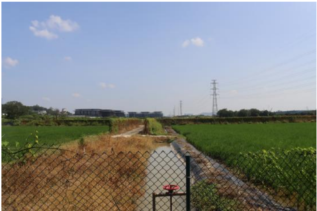
图 11 横一路地块内现状（西南-东北）