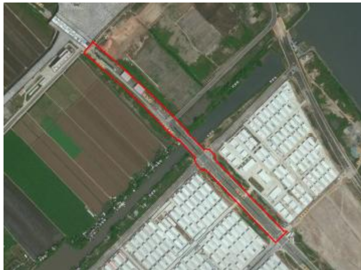
图 3 地块卫星红线图（世纪空间卫星影像图）