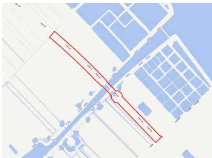
图 4 地块周边环境示意图（天地图）