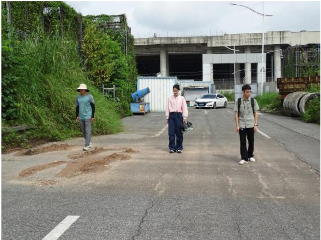
图 6 对地块地表进行踏查（东南-西北）