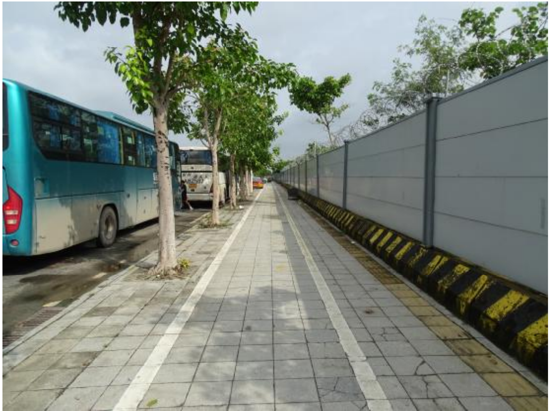
图 8 地块地表现状（东南-西北）