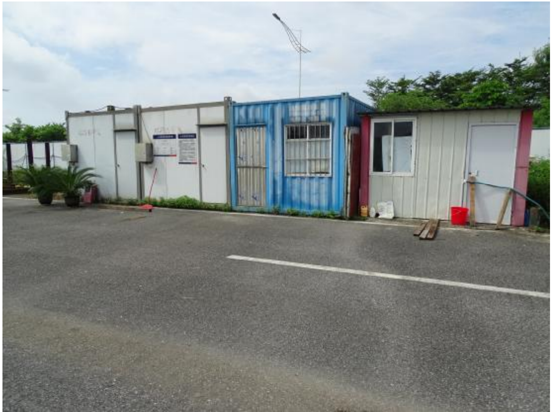
图 20 地块地表现状（北-南）