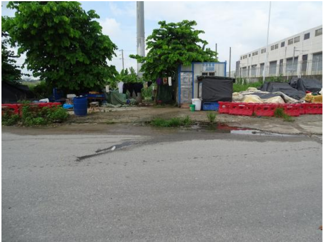
图 17 地块地表现状（北-南）