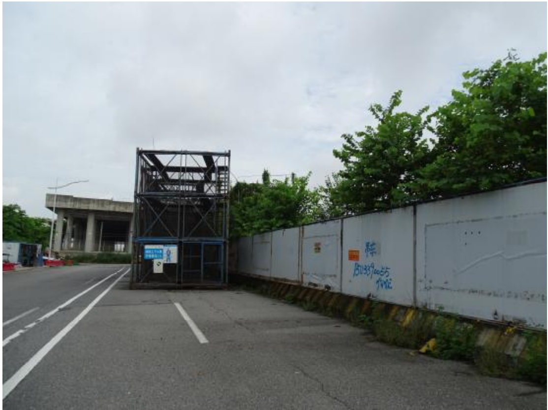
图 16 地块地表现状（东南-西北）