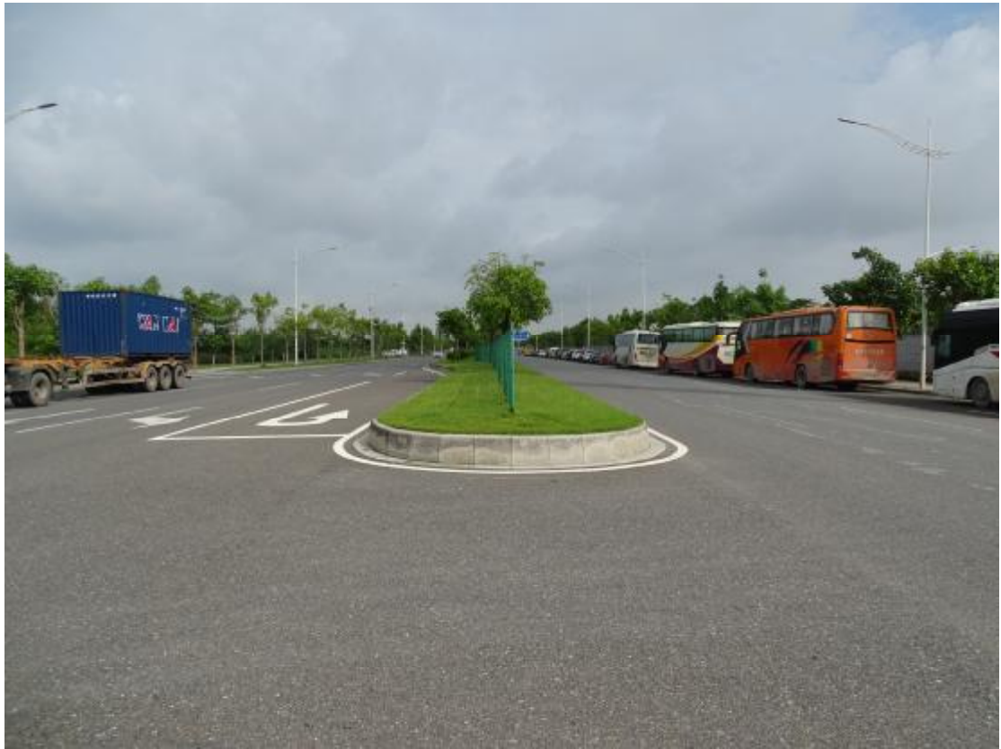
图 10 地块地表现状（东南-西北）