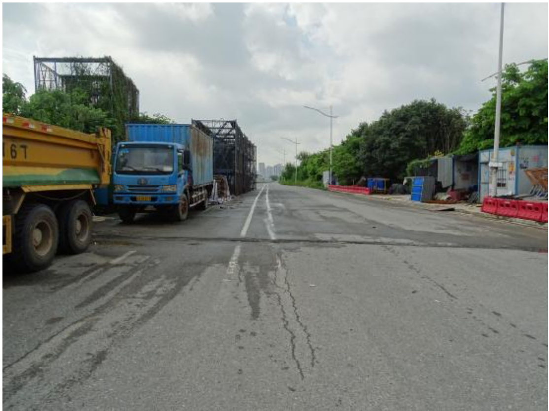
图 7 地块地表现状（西北-东南）