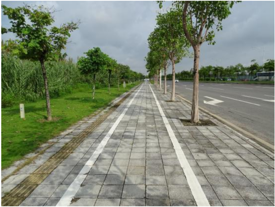
图 12 地块地表现状（东南-西北）