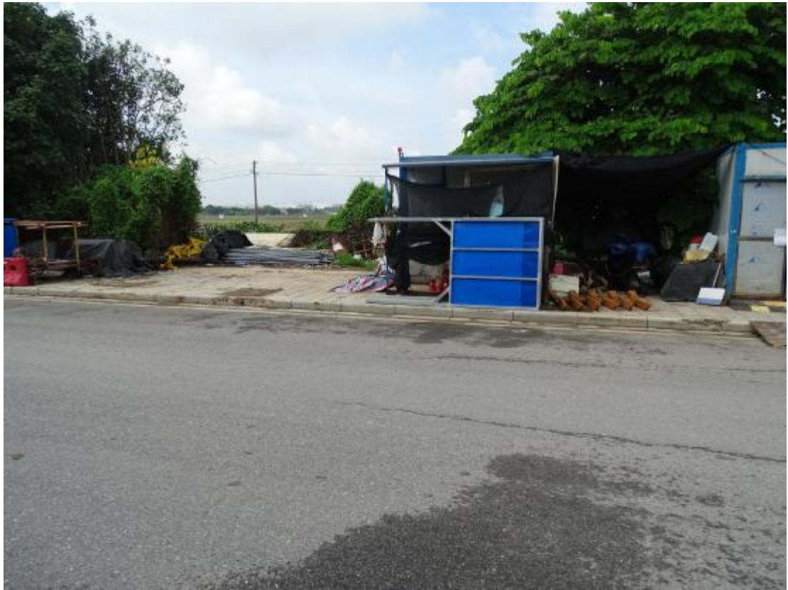
图 18 地块地表现状（北-南）