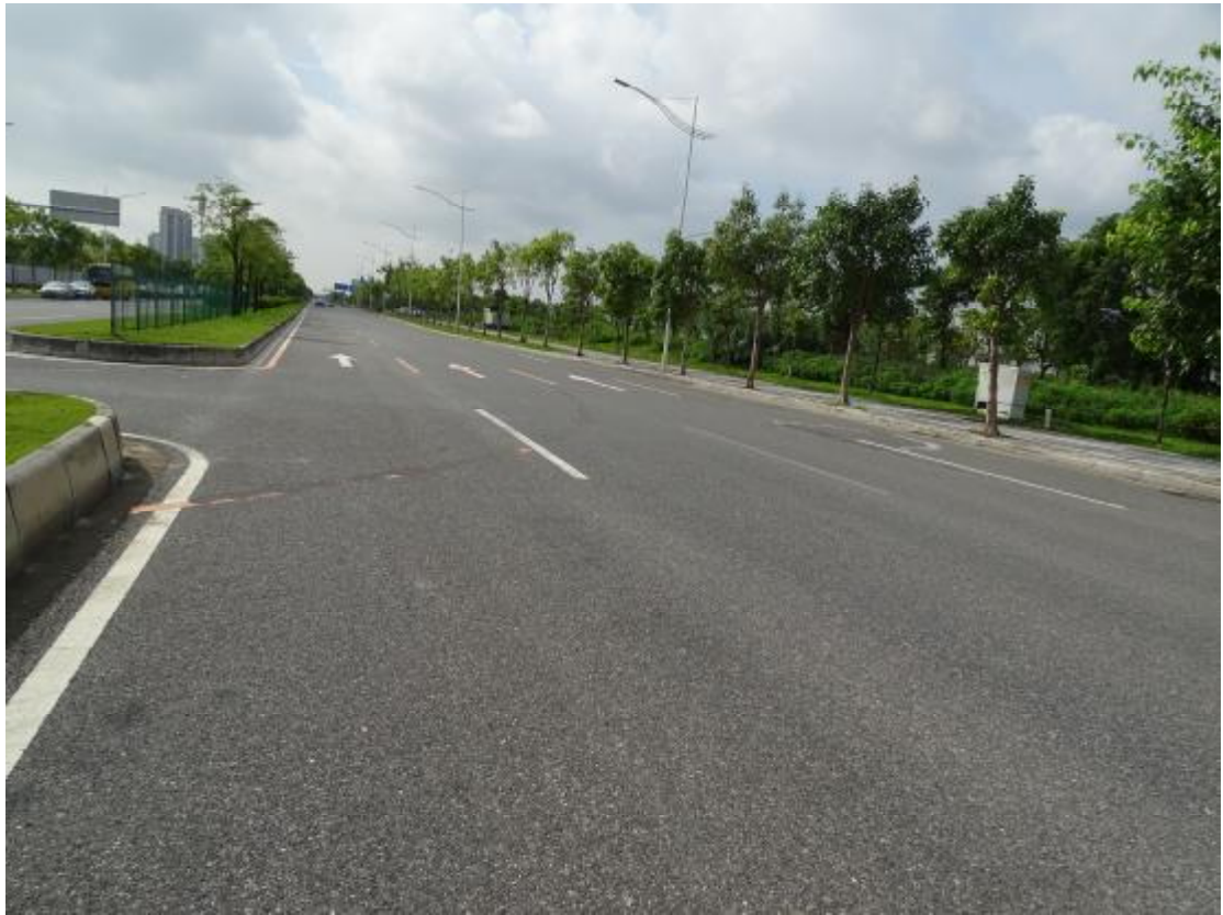
图 14 地块地表现状（西北-东南）