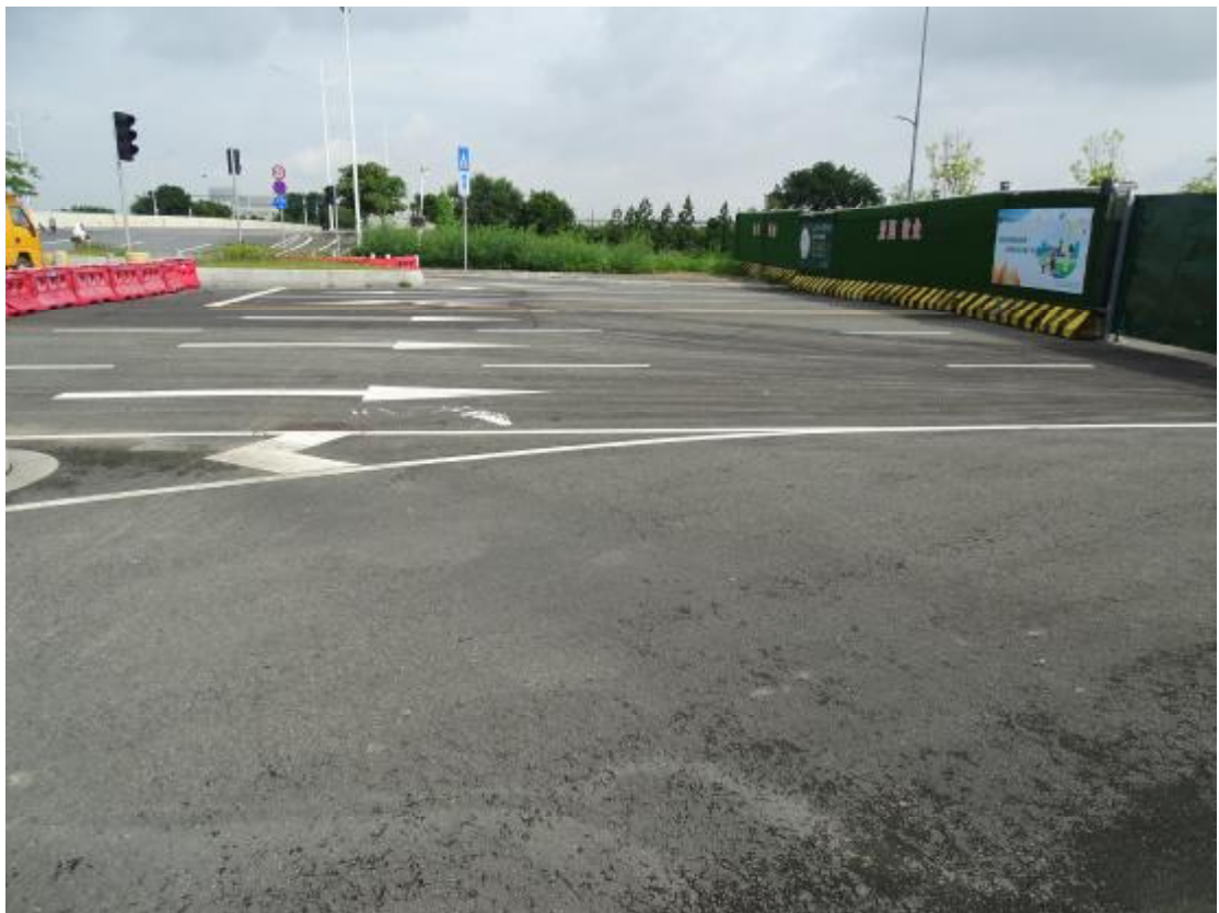
图 15 地块地表现状（东南-西北）