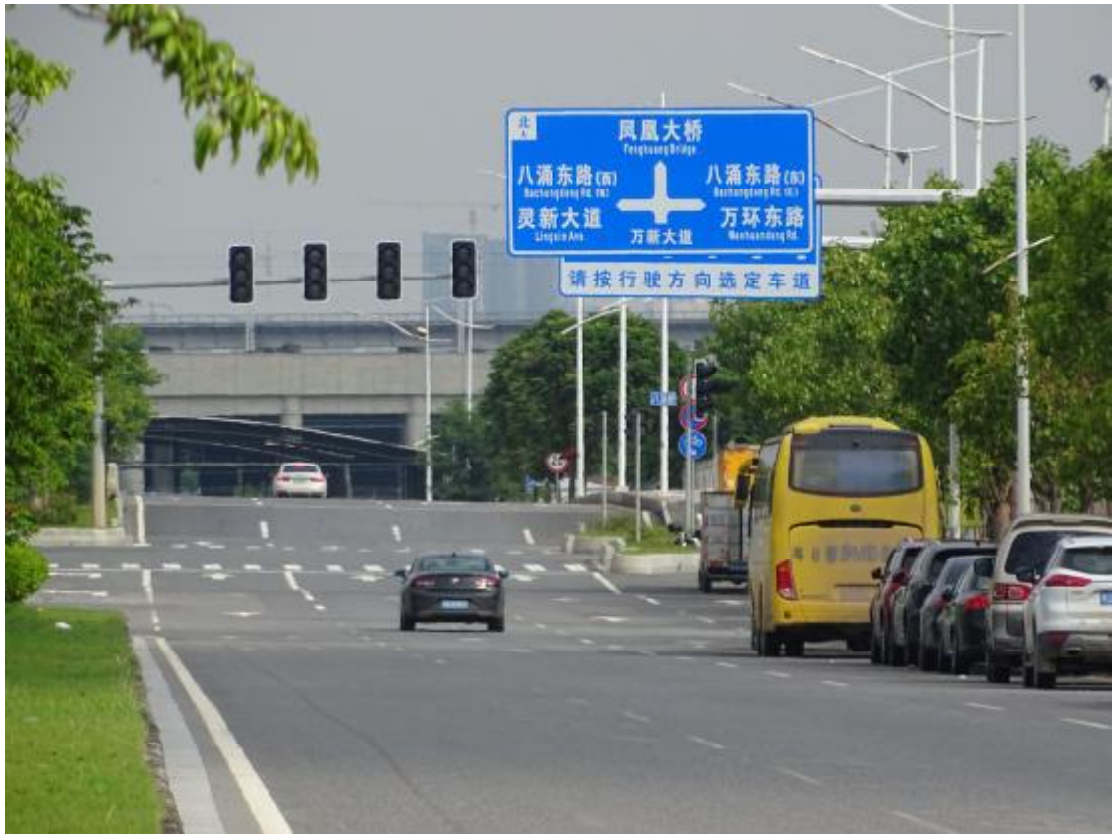
图 13 地块地表现状（东南-西北）