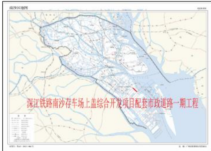
图 2 地块在南沙区的位置示意图（标准地图）