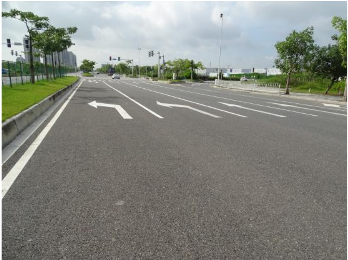
图 11 地块地表现状（西北-东南）