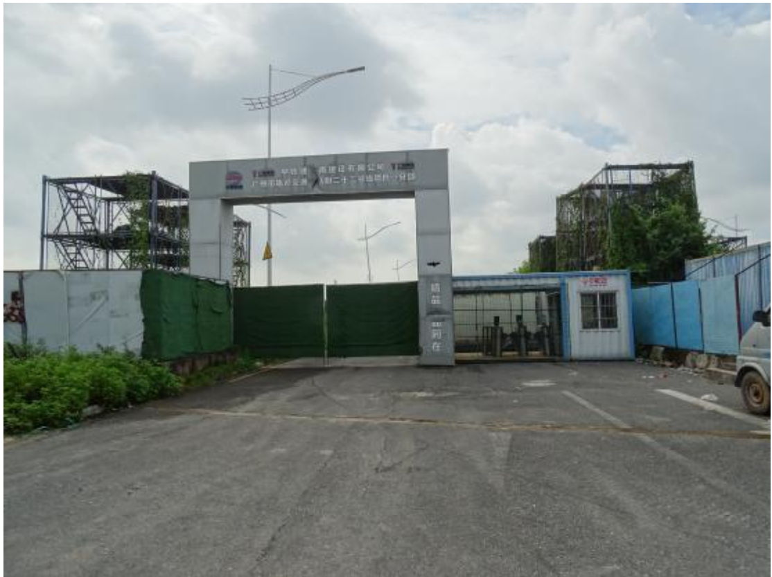
图 19 地块地表现状（西北-东南）