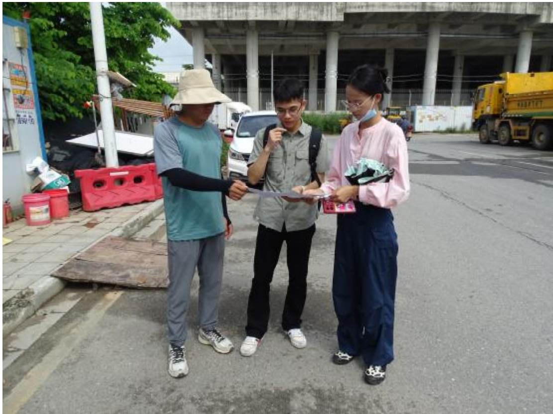
图 5 与工作人员确定地块范围（东南-西北）