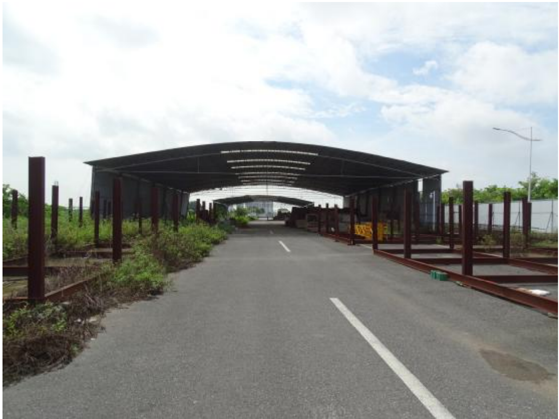
图 21 地块地表现状（西北-东南）