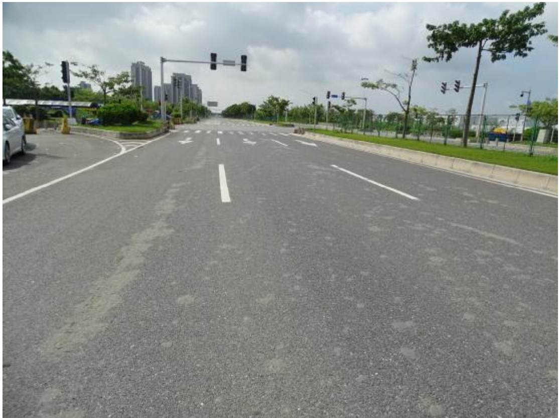
图 9 地块地表现状（东南-西北）