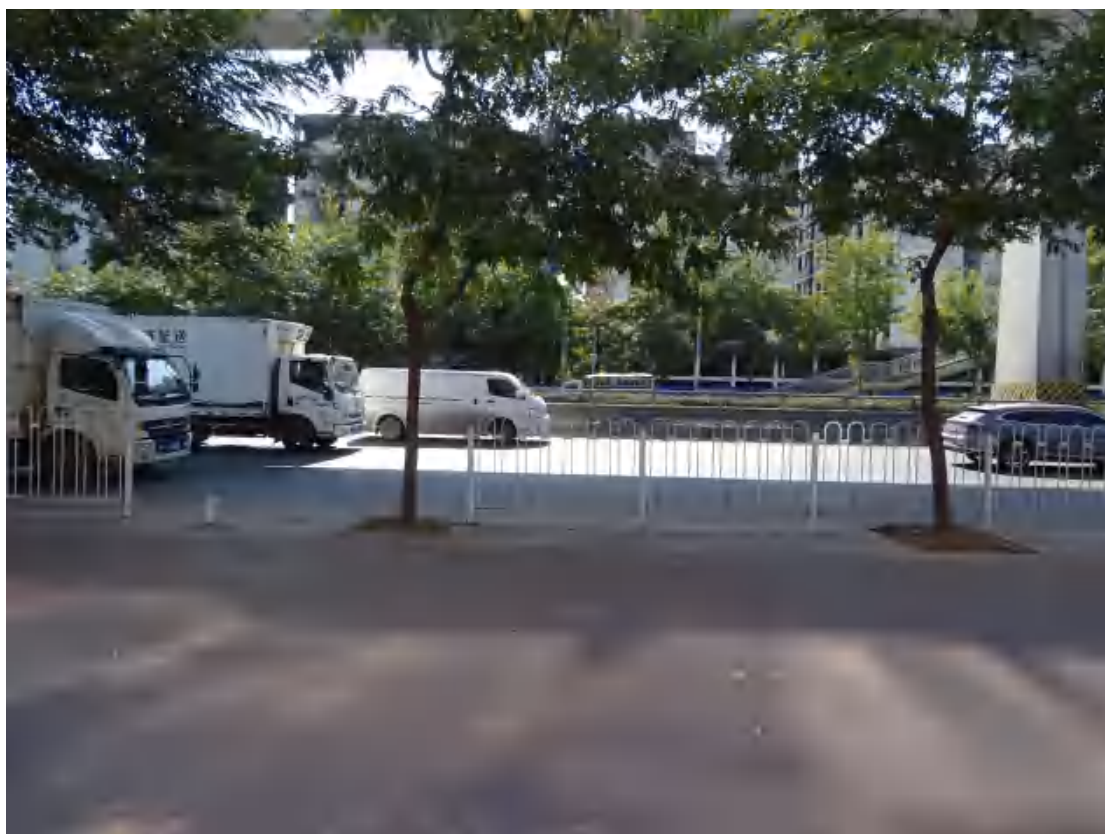
图 28 地块东部地表现状（西北-东南）