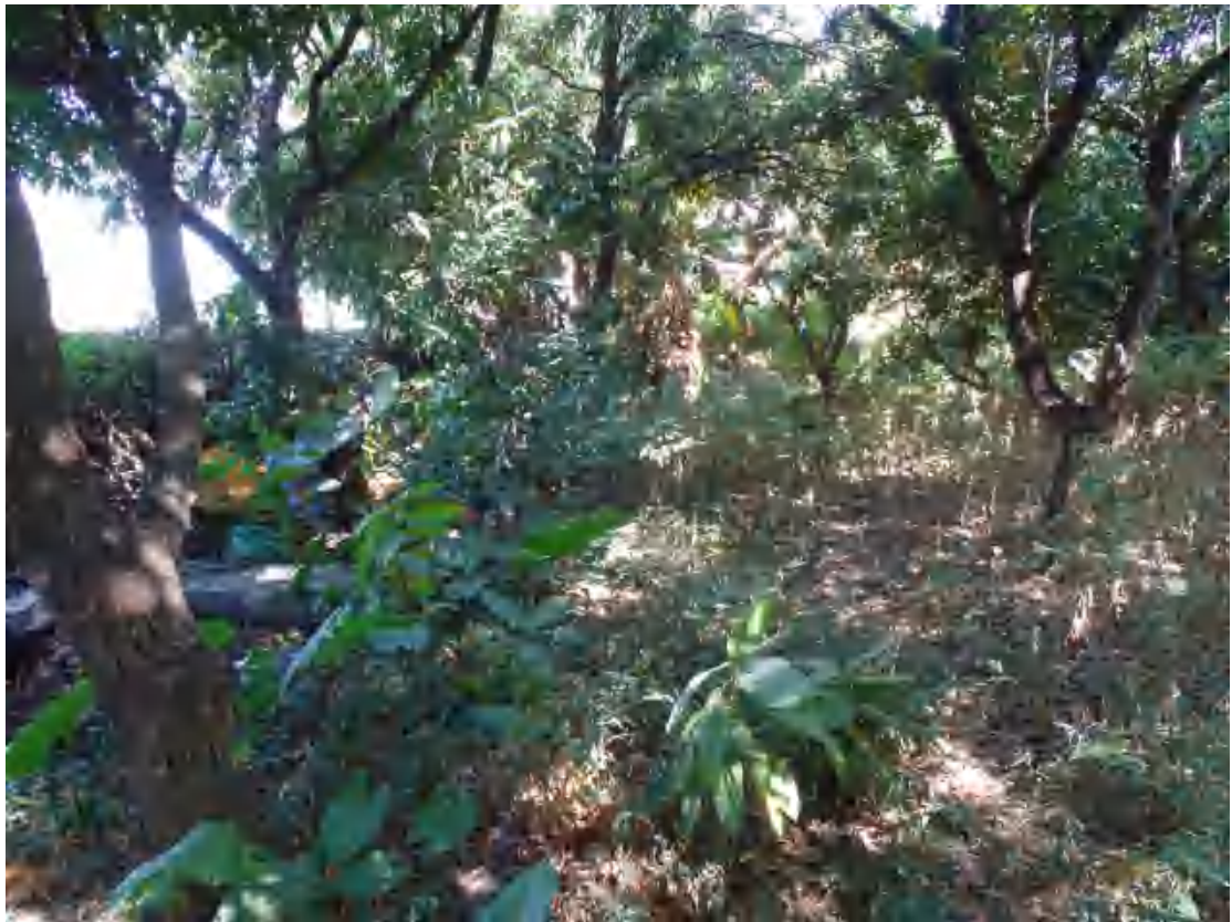
图 12 地块西部地表现状（南-北）