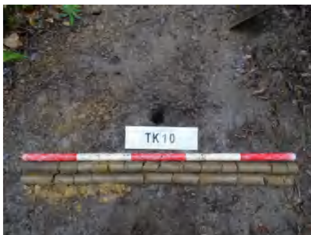
图 44 TK10 土样（一米标杆，土样由左上往右下）

②层：黏土层，距地表深约 0.15-2.0 米，厚约 1.85 米，为灰褐色黏土，土质较疏松，含植物根茎等；以下为黄褐色沙土，土质致密、纯净，系生土。