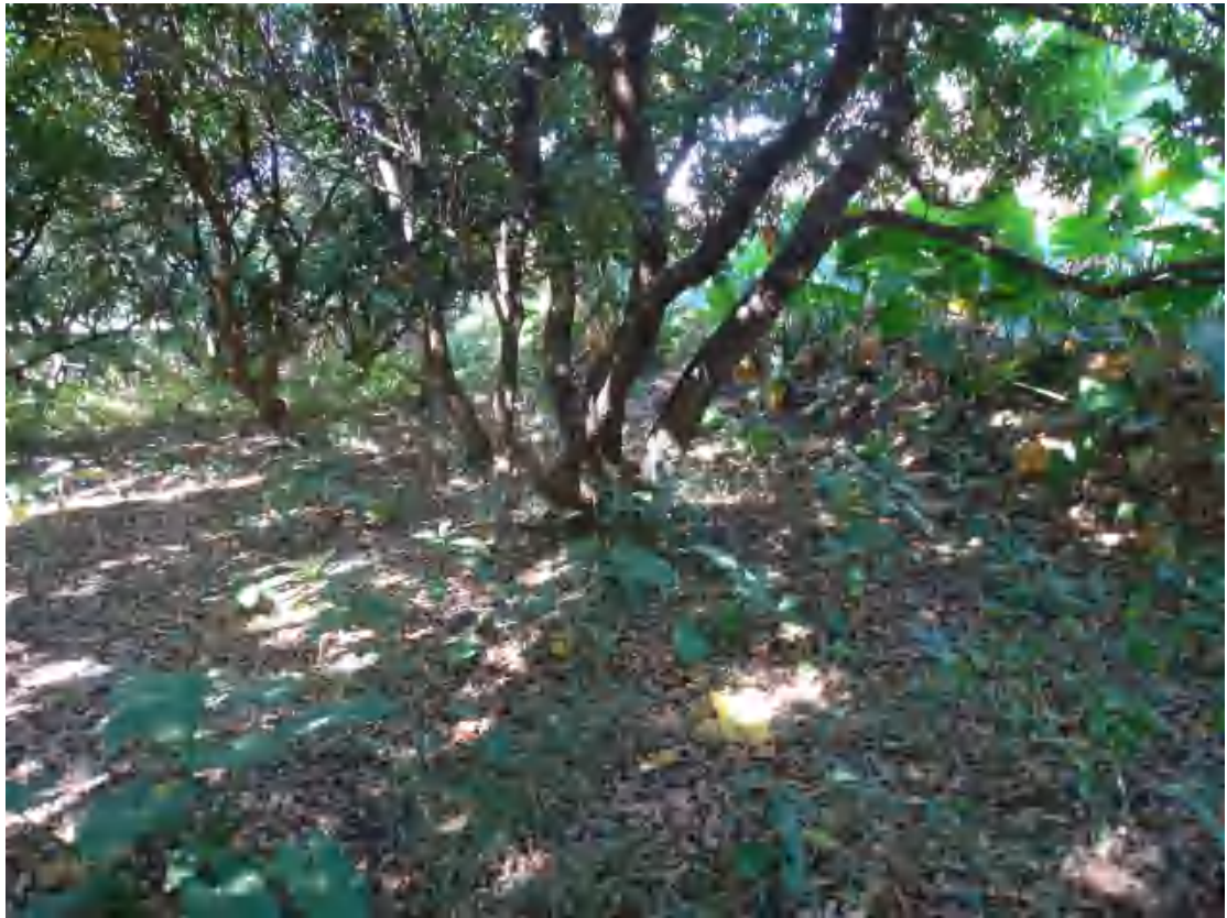
图 11 地块西部地表现状（东-西）