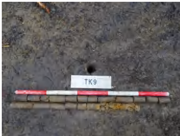
图 43 TK9 土样（一米标杆，土样由左上往右下）

②层：黏土层，距地表深约 0.2-1.4 米，厚约 1.2 米，为灰褐色黏土，土质较疏松，含植物根茎等；以下为黄褐色沙土，土质致密、纯净，系生土。