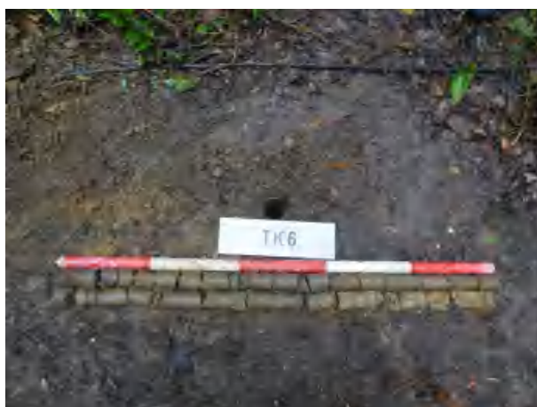
图 40 TK6 土样（一米标杆，土样由左上往右下）

②层：黏土层，距地表深约 0.2-1.6 米，厚约 1.4 米，为灰褐色黏土，土质较疏松，含植物根茎等；以下为黄褐色沙土，土质致密、纯净，系生土。