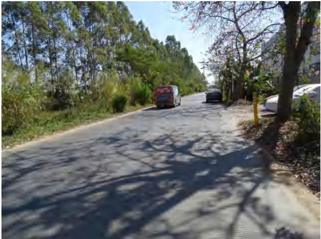
图 14 地块中部地表现状（西北-东南）