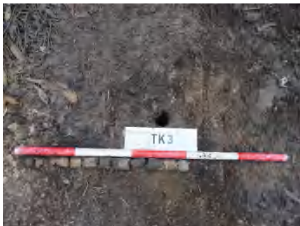
图 37 TK3 土样（一米标杆，土样由左往右）

①层：现代回填土层，距地表深约 0-0.6 米，厚约 0.6 米，为黄褐色夹杂灰褐色沙土，土质疏松，含植物根系等；探至 0.6 米，遇石块阻拦，无法提取土样。