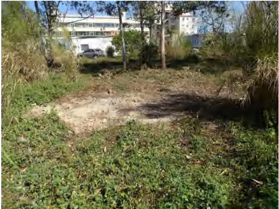
图 15 地块中部地表现状（西南-东北）