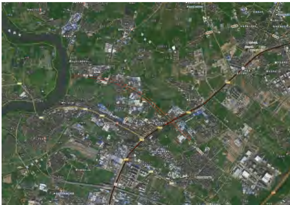
图 3 地块卫星红线图（世纪空间卫星影像图）