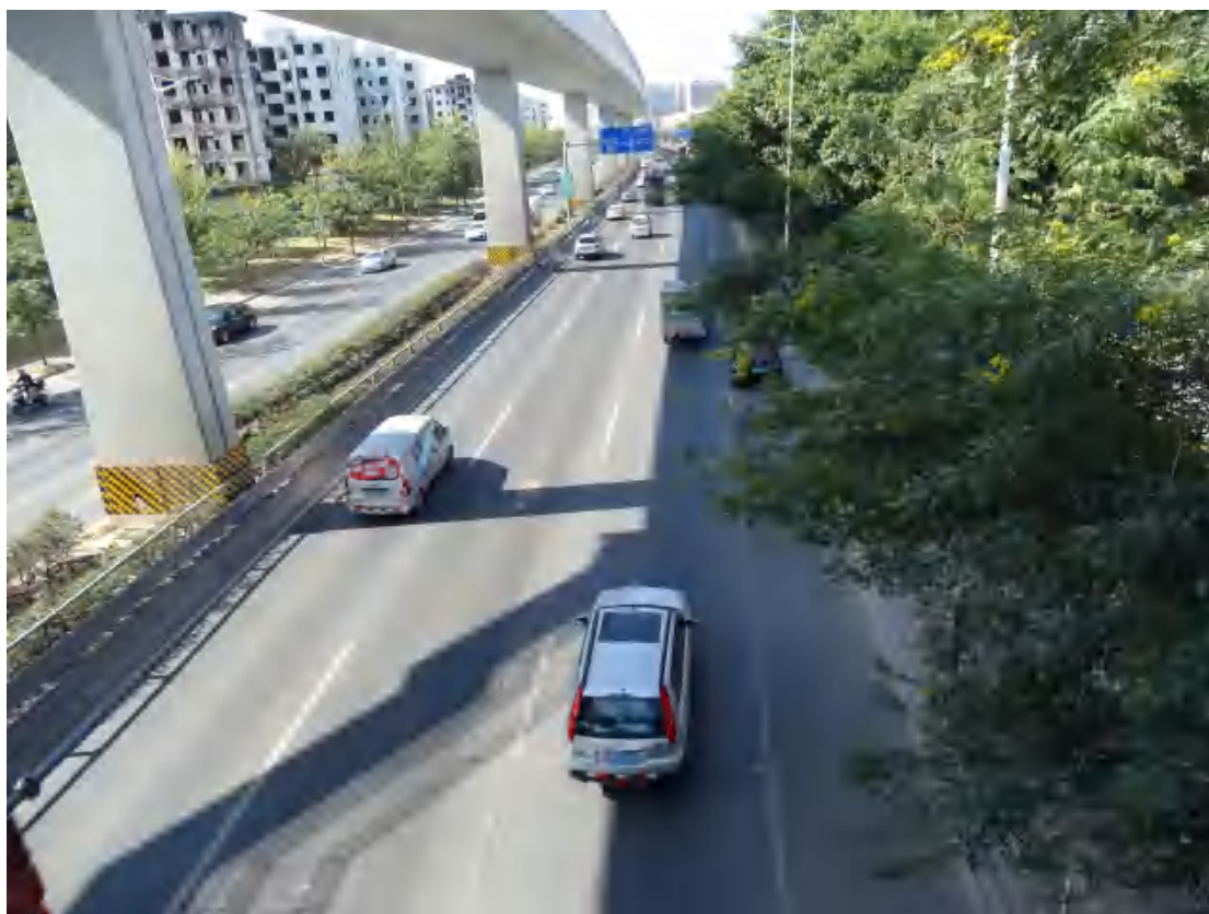
图 27 地块东部地表现状（东北-西南）