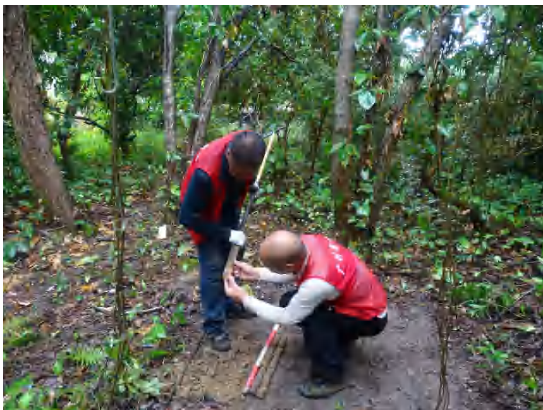
图 32 试探孔土样分析（西-东）