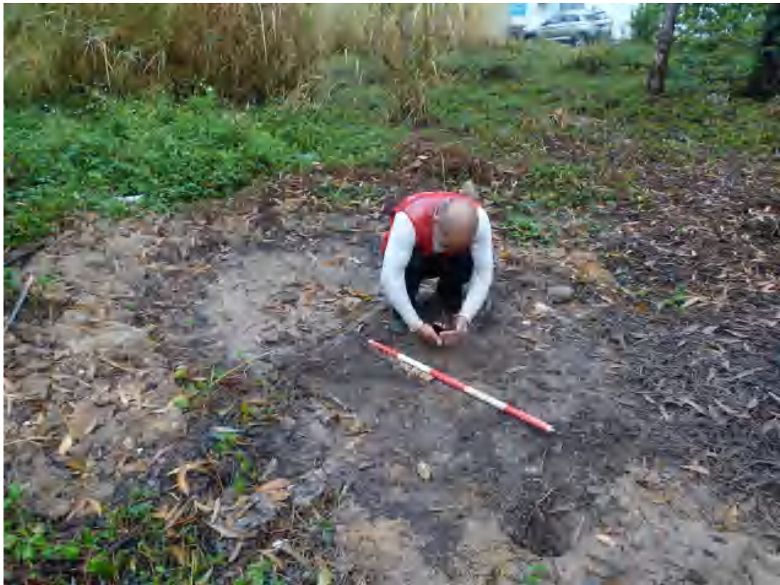
图 34 试探孔坐标 GPS 数据测量（东北-西南）