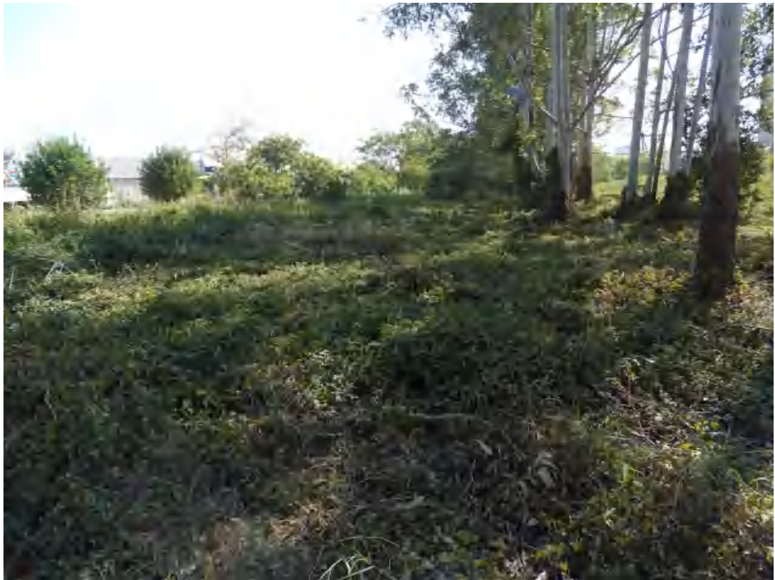
图 18 地块中部地表现状（西北-东南）