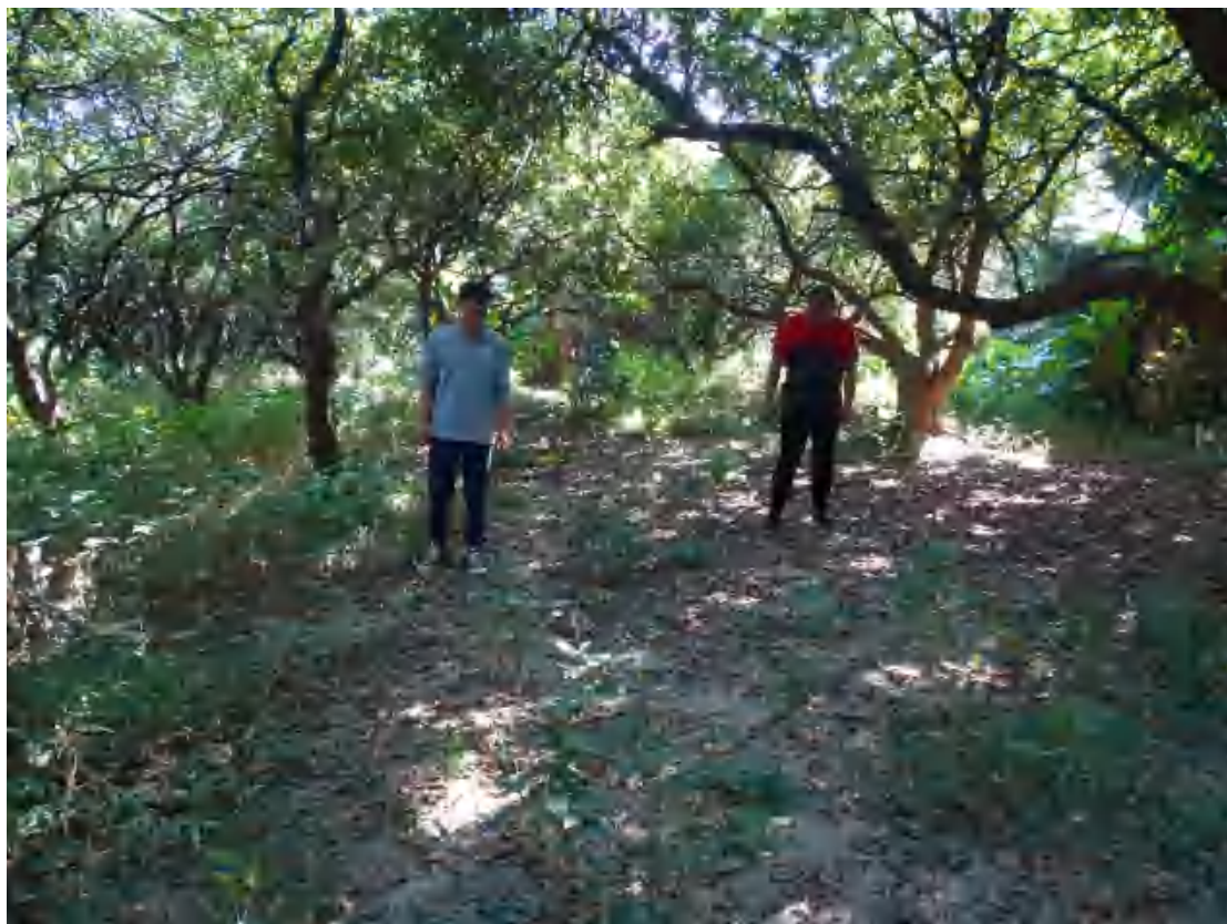
图 7 现场踏查（东-西）