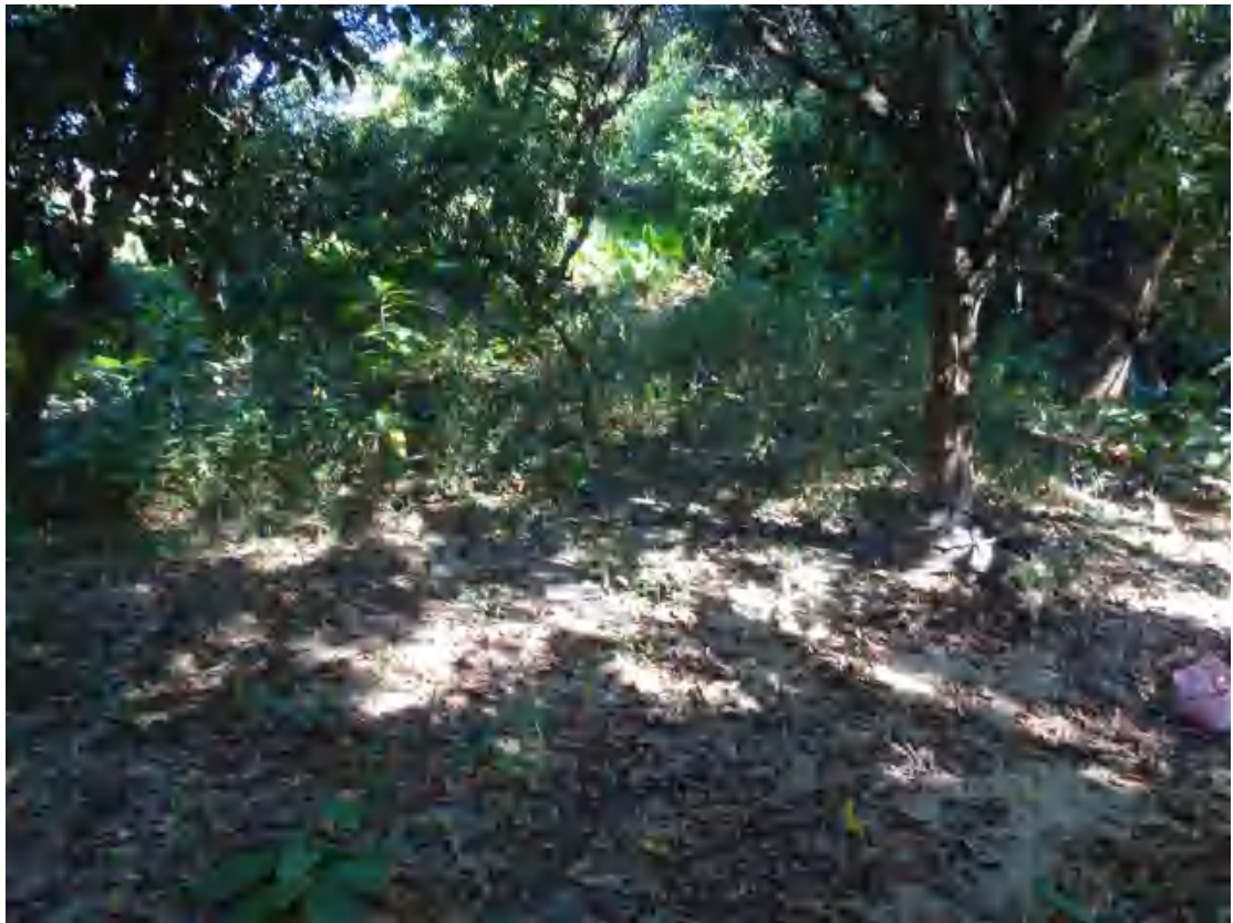
图 10 地块西部地表现状（南-北）