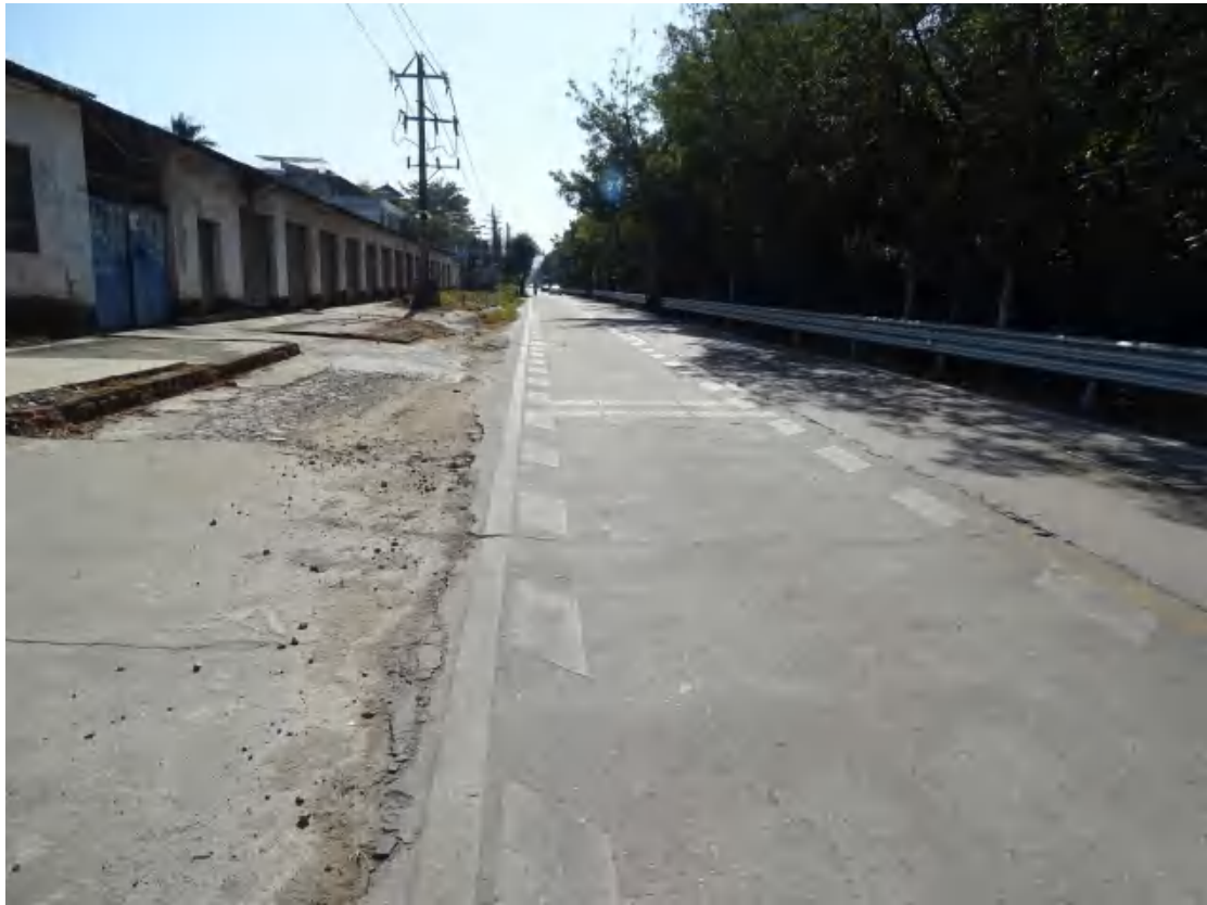
图 19 地块东部地表现状（西北-东南）