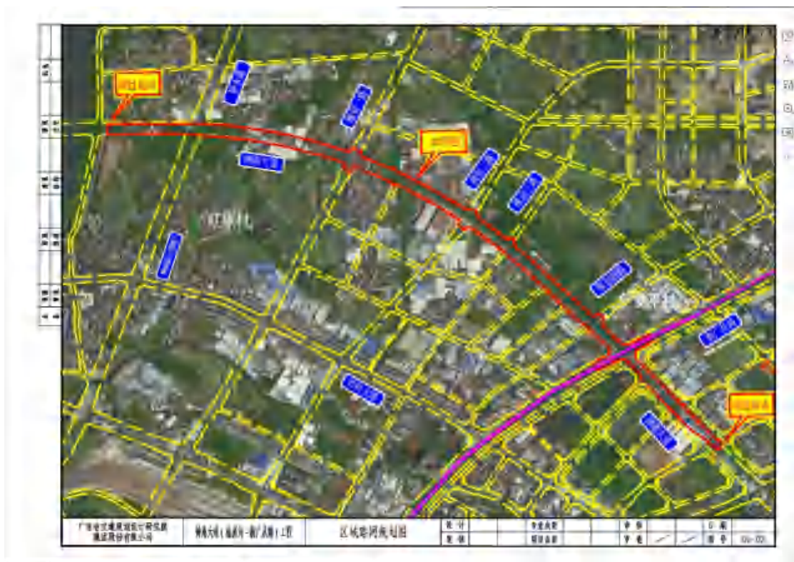
图 5 项目区域路网规划图