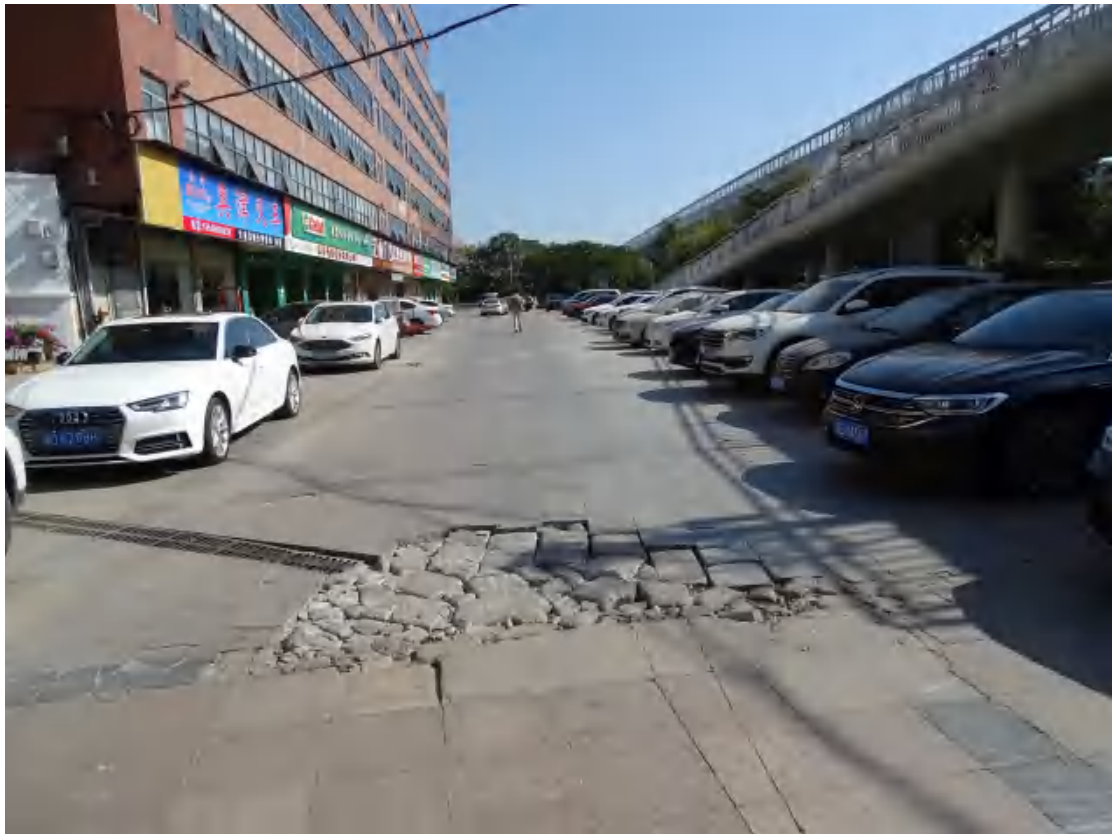
图 22 地块东部地表现状（西南-东北）