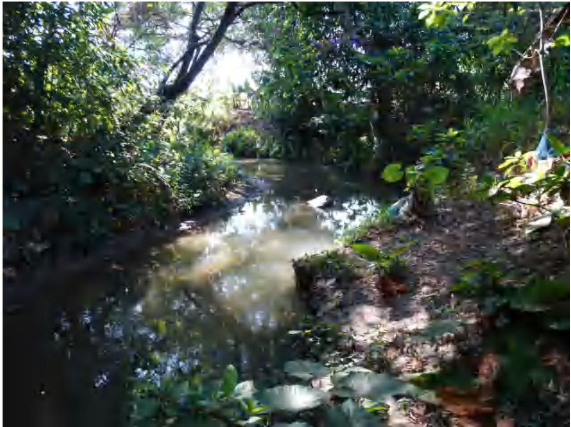
图 9 地块西部地表现状（北-南）