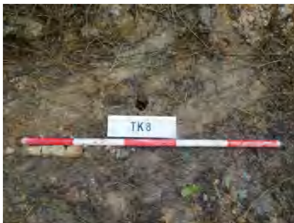
图 42 TK8 土样（一米标杆，土样由左往右）

①层：现代回填土层，距地表深约 0-0.4 米，厚约 0.4 米，为黄褐色夹杂灰褐色沙土，土质疏松，含植物根系等；探至 0.4 米，遇石块阻拦，无法提取土样。