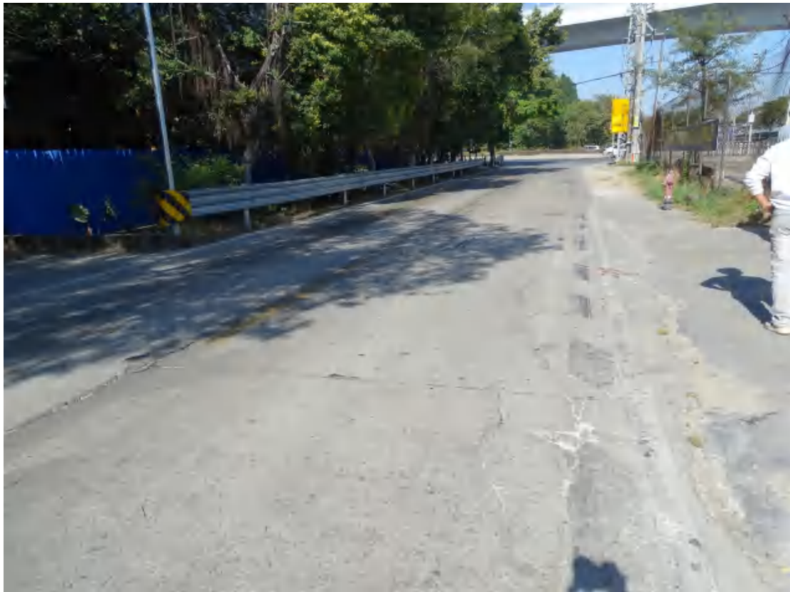
图 20 地块东部地表现状（东南-西北）