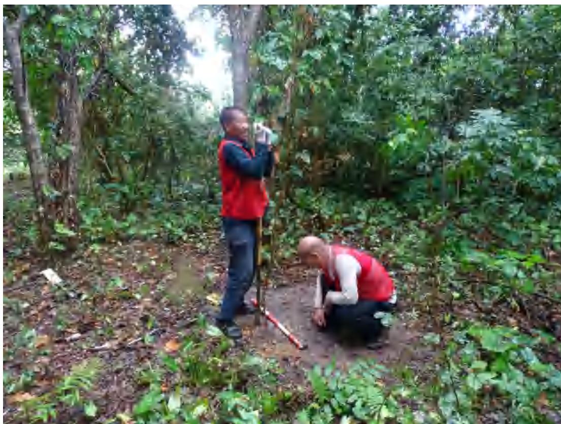
图 31 试探孔土样提取（南-北）