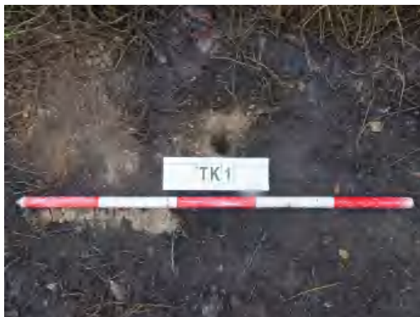
图 35 TK1 土样（一米标杆，土样由左往右）

①层：现代回填土层，距地表深约 0-0.4 米，厚约 0.4 米，为黄褐色夹杂灰褐色沙土，土质疏松，含植物根系等；探至 0.4 米，遇石块阻拦，无法提取土样。