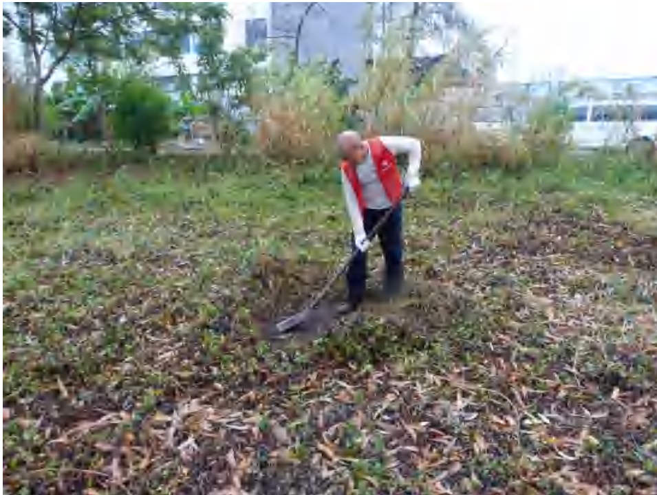
图 30 试探区域清理（西南-东北）