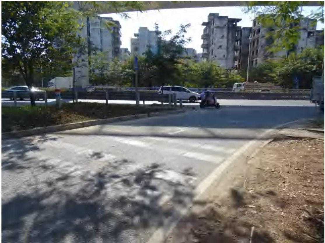
图 23 地块东部地表现状（西北-东南）