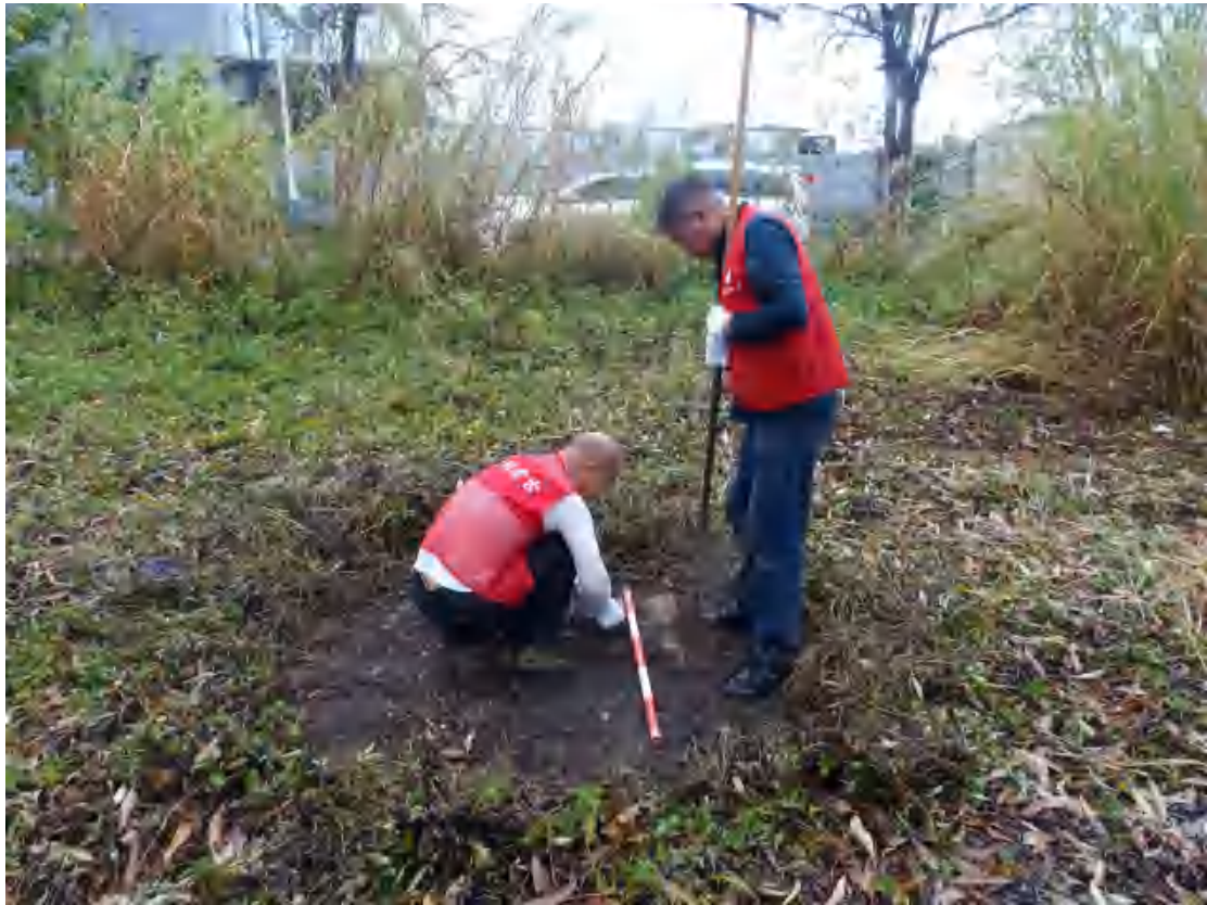
图 33 试探孔土样摆放（西南-东北）