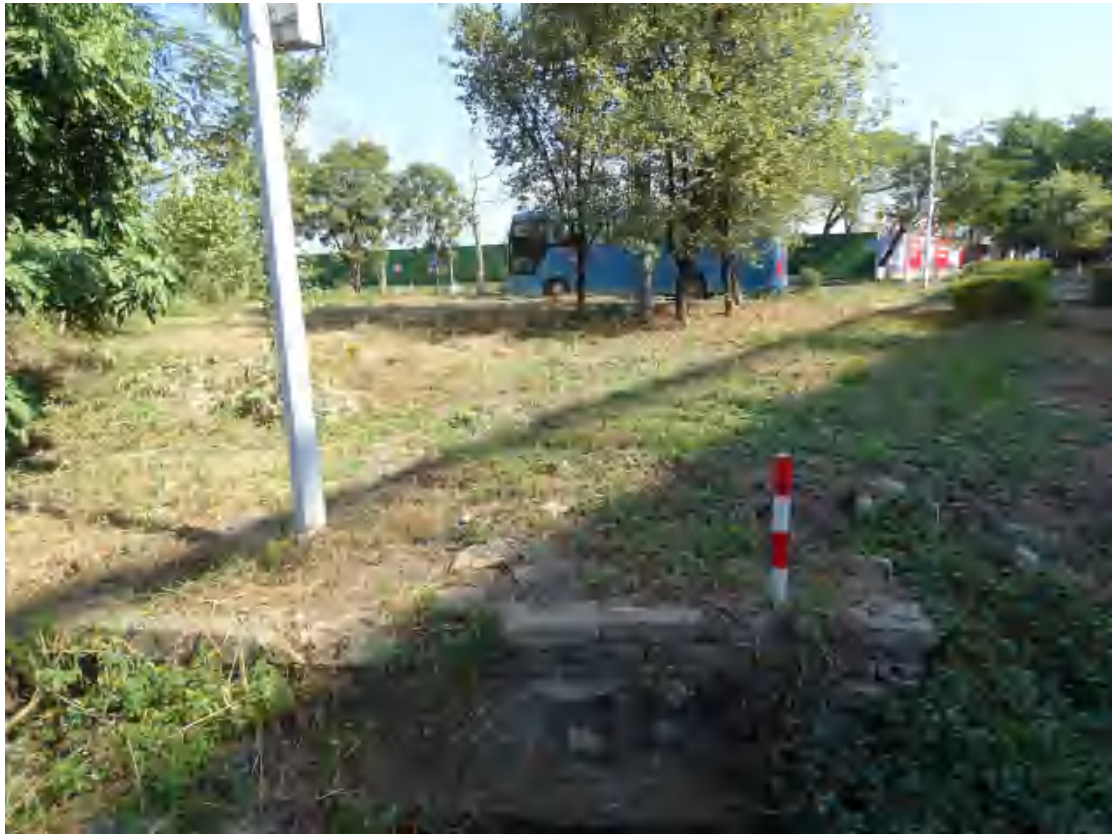
图 25 地块东部地表现状（西南-东北）