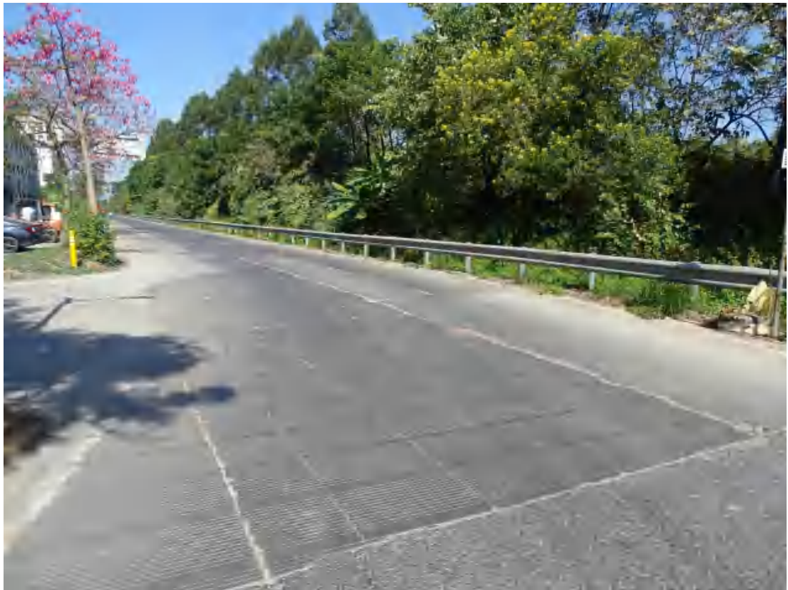
图 24 地块东部地表现状（东南-西北）