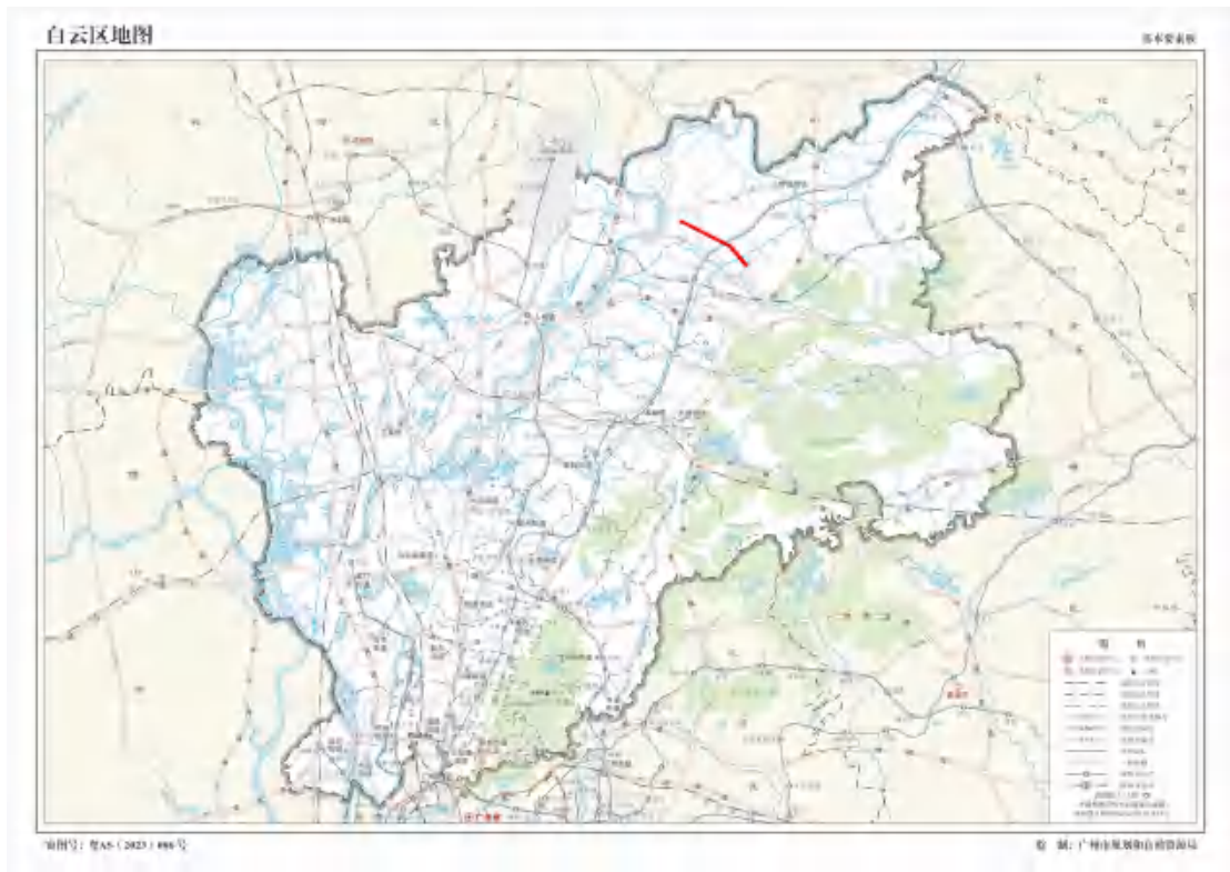
图 2 地块在南沙区的位置示意图（标准地图）