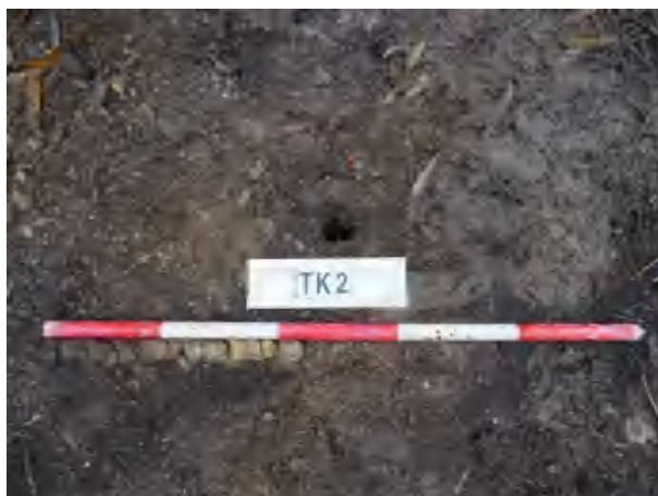
图 36 TK2 土样（一米标杆，土样由左往右）

①层：现代回填土层，距地表深约 0-0.4 米，厚约 0.4 米，为黄褐色夹杂灰褐色沙土，土质疏松，含植物根系等；探至 0.4 米，遇石块阻拦，无法提取土样。