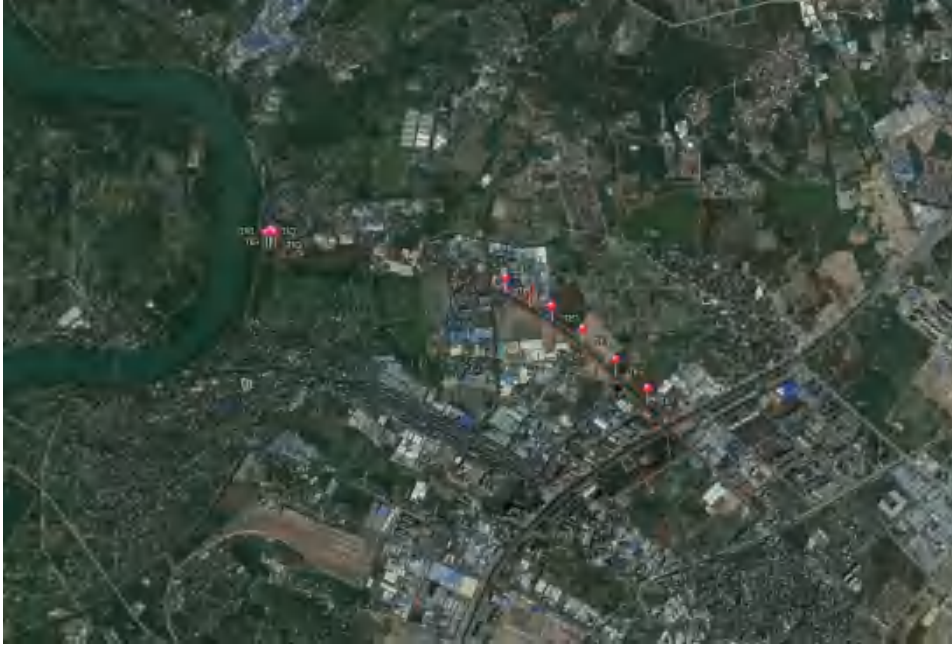
图 29 试探孔位置分布示意图

根据地形地貌及考古调查的工作需要,为了进一步了解并掌握该项目用地内地层堆积情况,我们在用地范围内进行试探,共布设 10 个标准型试探孔,编号为 TK1-TK10,具体介绍如下: