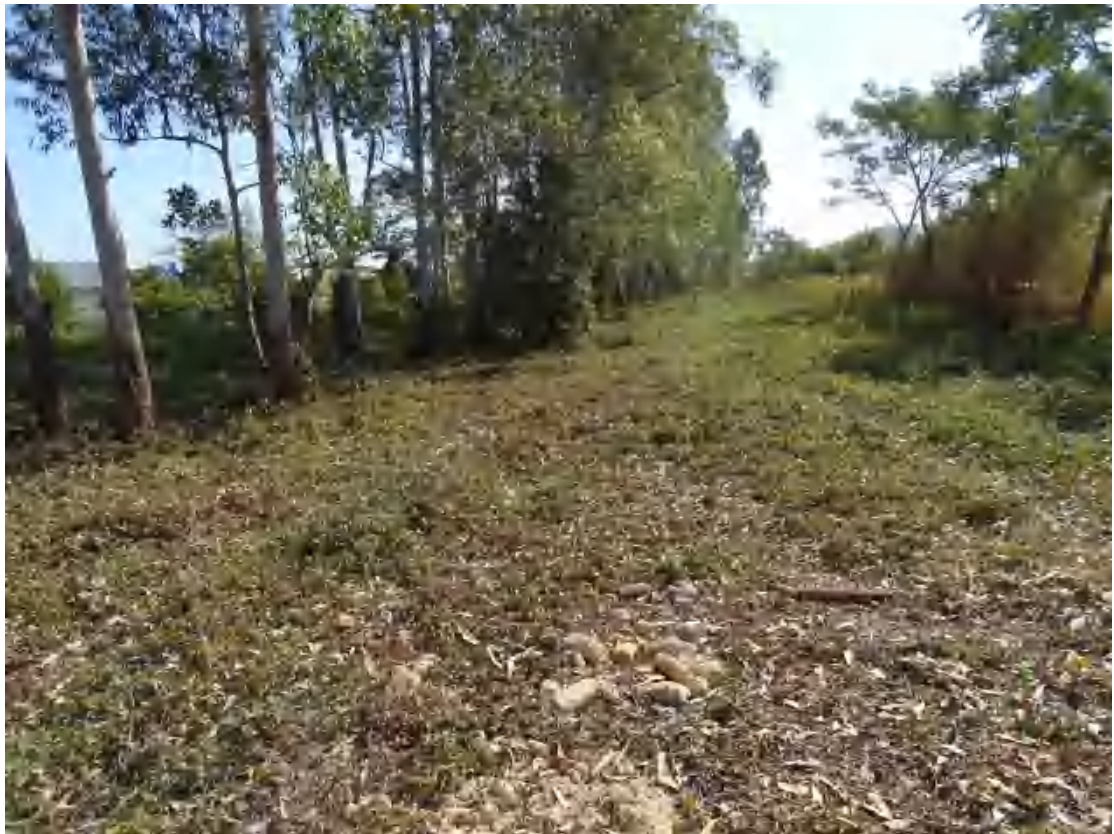
图 16 地块中部地表现状（西北-东南）