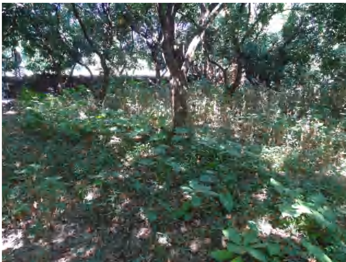
图 8 地块西部地表现状（东-西）