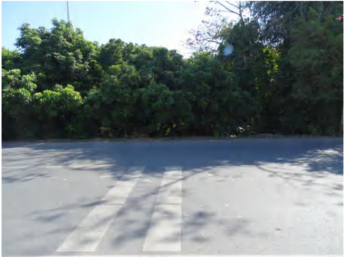
图 13 地块西部地表现状（西-东）