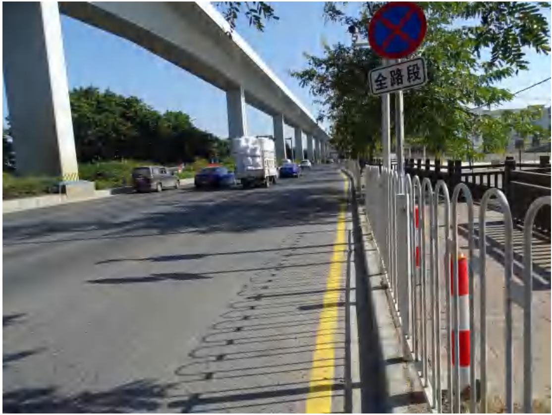
图 21 地块东部地表现状（西南-东北）