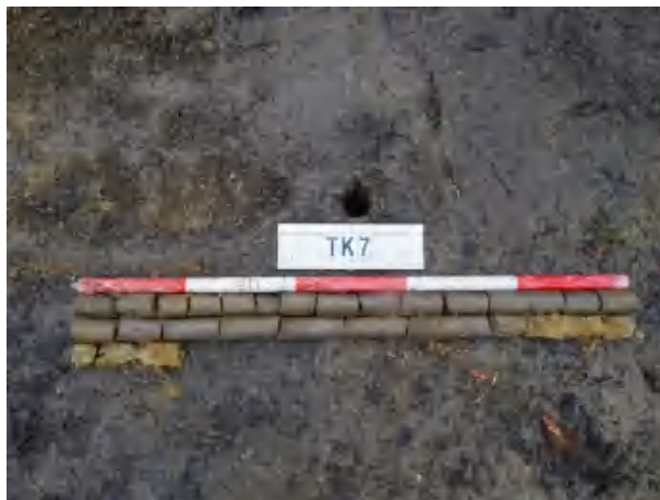
图 41 TK77 土样（一米标杆，土样由左上往右下）

②层：黏土层，距地表深约 0.1-1.8 米，厚约 1.7 米，为灰褐色黏土，土质较疏松，含植物根茎等；以下为黄褐色沙土，土质致密、纯净，系生土。