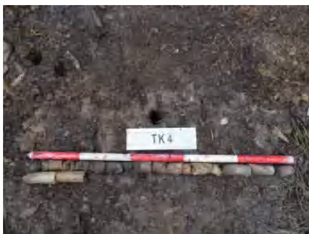
图 38 TK4 土样（一米标杆，土样由左上往右下）

①层：现代回填土层，距地表深约 0-0.8 米，厚约 0.8 米，为黄褐色夹杂灰褐色沙土，土质疏松，含植物根系等；以下为黄褐色黏土，土质致密、纯净，系生土。