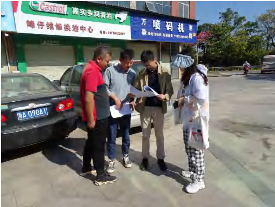
图6 与现场工作人员确定地块范围（西南-东北）