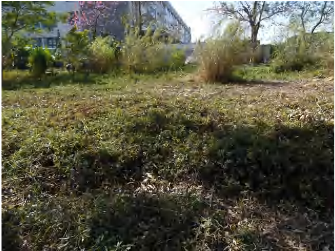
图 17 地块中部地表现状（东北-西南）