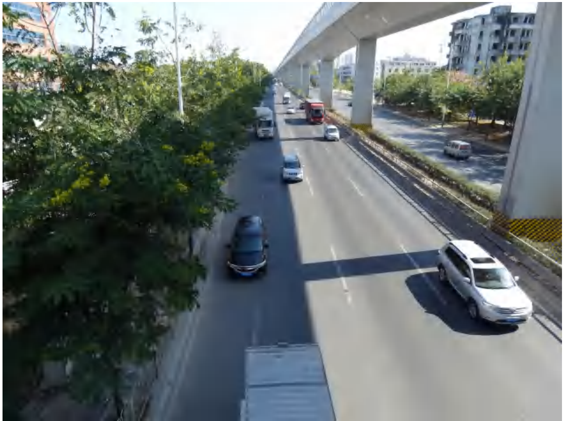
图 26 地块东部地表现状（西南-东北）