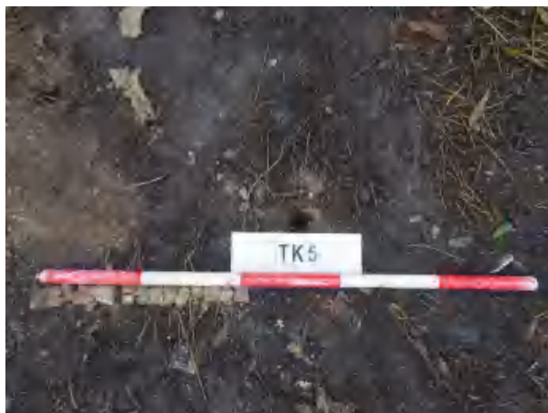
图 39 TK5 土样（一米标杆，土样由左往右）

①层：现代回填土层，距地表深约 0-0.4 米，厚约 0.4 米，为黄褐色夹杂灰褐色沙土，土质疏松，含植物根系等；探至 0.4 米，遇石块阻拦，无法提取土样。