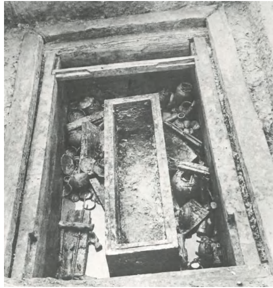
图 12 柳园岗 M11 棺具及随葬器物