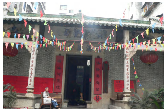
图 8 瑶溪蔡公祠