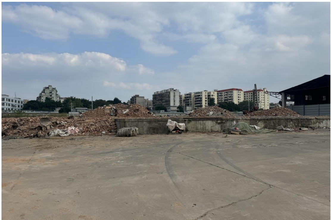
图 22 地块东北部现状（西-东）