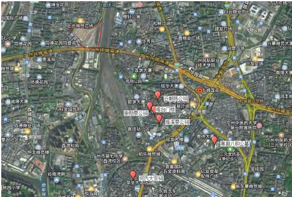
图 6 项目地块周边不可移动文物分布示意图（腾讯卫星地图）

该项目范围内未发现不可移动文物，周边有部分文物资源。根据《广州市文物普查汇编·越秀区卷》，该项目周边的不可移动文物有近朝陈公祠、瑶溪蔡公祠、崇勋蔡公祠、何氏大宗祠、瑶台门楼、粤剧八和公墓，详细介绍如下：