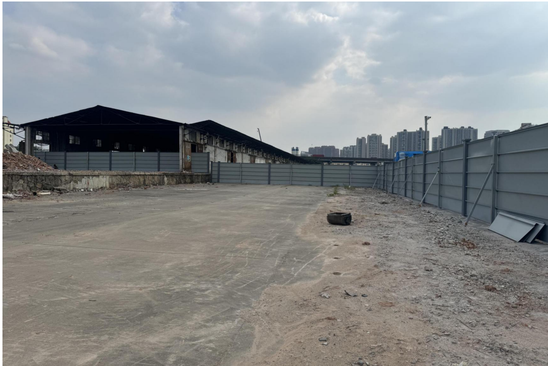
图 24 地块东北部现状（北-南）