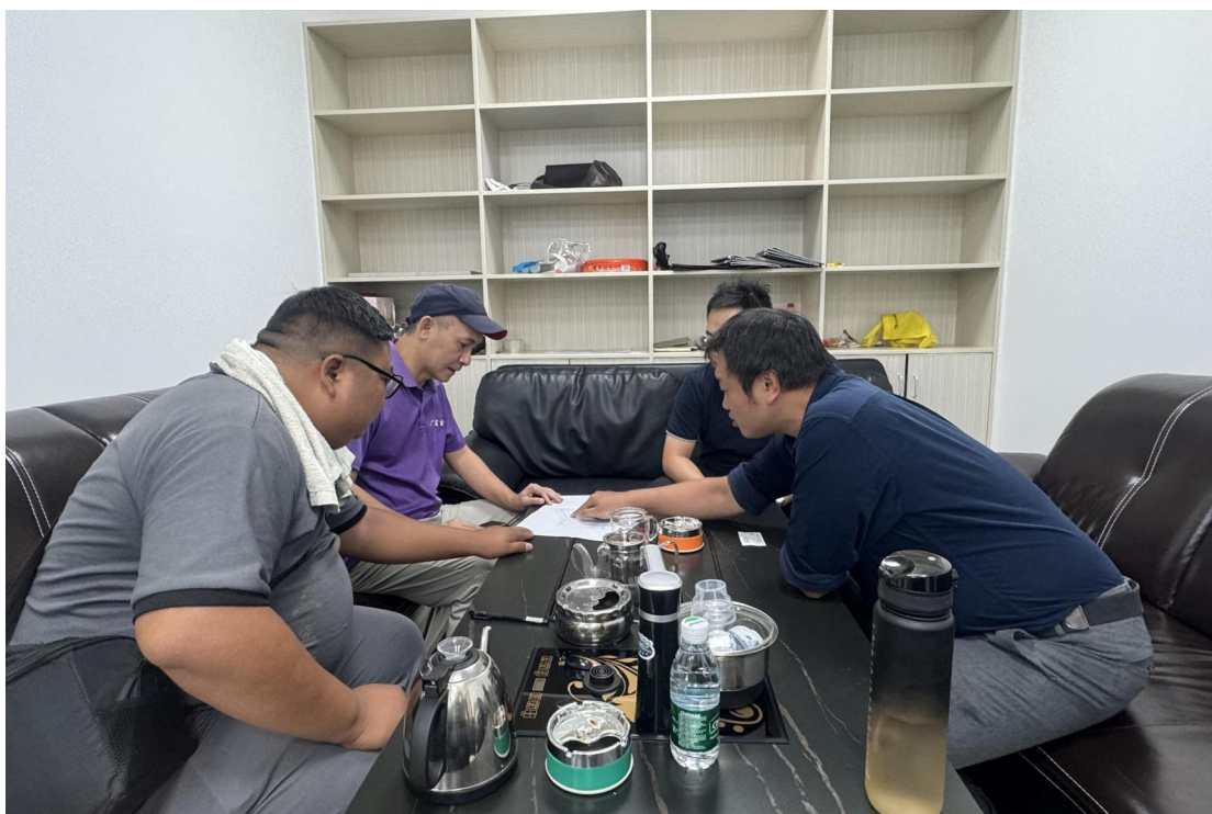
图 16 工作人员会议讨论项目情况