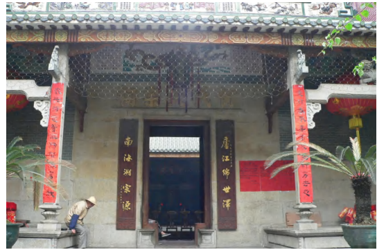
图 10 何氏大宗祠

瑶台门楼 又称红门楼、西闸门。位于矿泉街瑶台向阳大街 42 号。据说始建于明代。坐东朝西，正面阔 4.25 米，深 4.25 米，建筑面积 18.5 平方米。建筑为砖木结构，青砖外墙。现前贴红瓷砖、内墙贴白瓷砖，上盖琉璃瓦。花岗石门额阴刻“瑶台”二字。