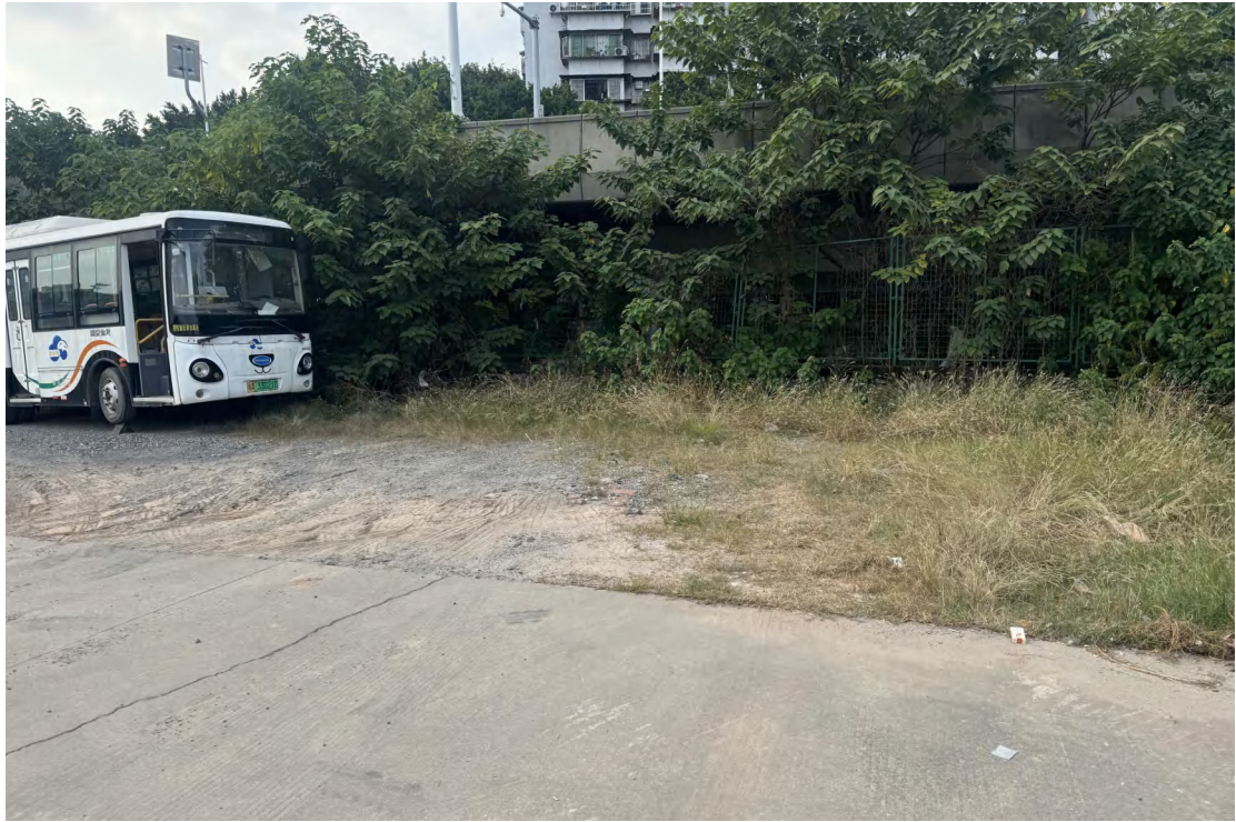
图 18 地块北部现状（东南-西北）