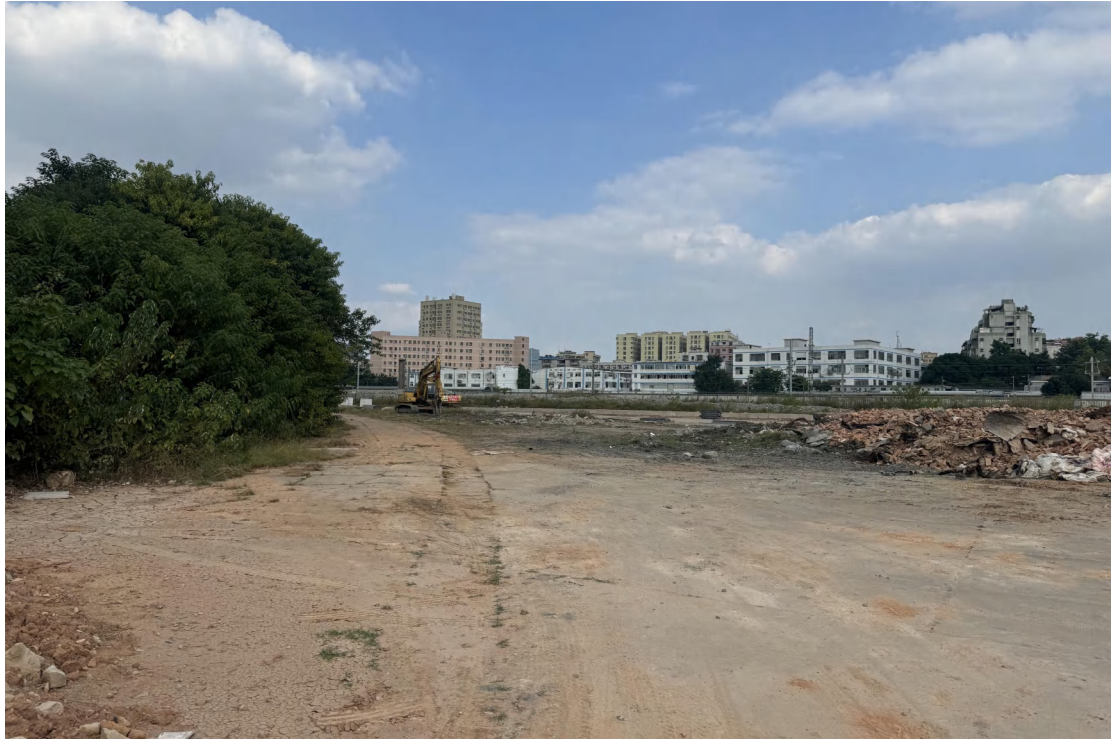
图 19 地块北部现状（南-北）