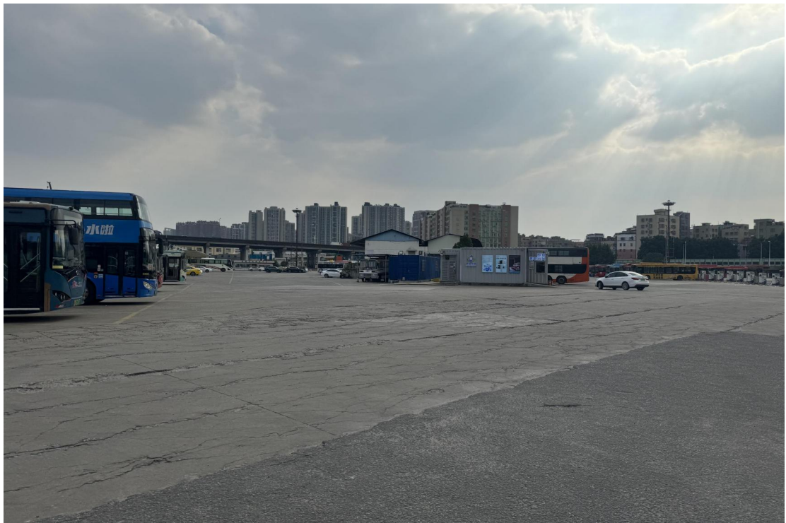
图 26 地块中部、南部现状（东北-西南）