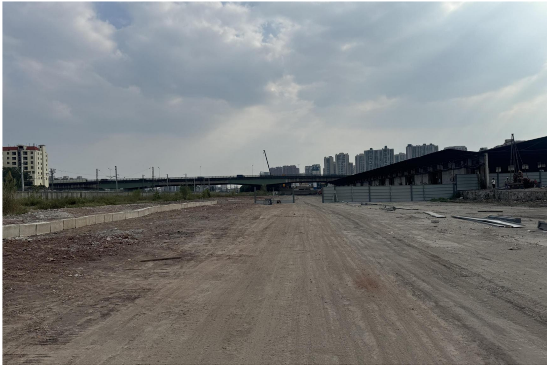
图 23 地块东北部现状（北-南）