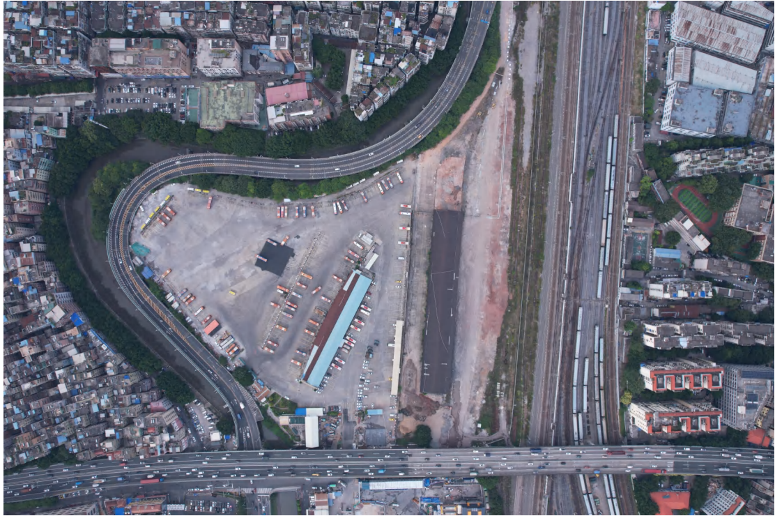
图 17 项目地块现状（上为北）