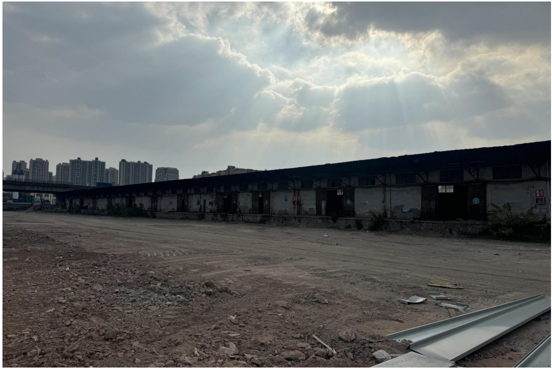
图 21 地块东北部现状（东北-西南）