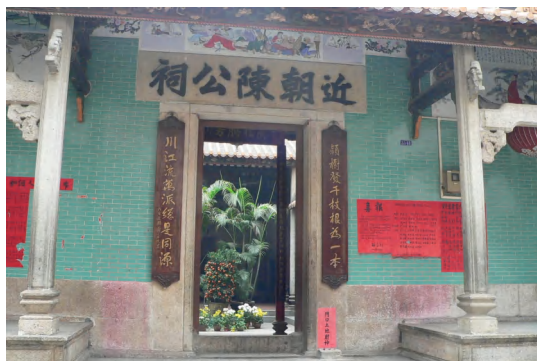
图 7 近朝陈公祠

瑶溪蔡公祠 位于矿泉街瑶台朝阳大街 9 号。坐西朝东。祠堂门前旷地 180 平方米。绿琉璃瓦硬山顶，青砖墙石脚，石檐柱，木金柱，内墙贴瓷砖，外墙全部采用原保留的明线青砖，红色耐磨砖地板，木行瓦下沿祠堂内墙及大门口墙楣配壁画诗词，两组石柱对联，6 组木刻对联。