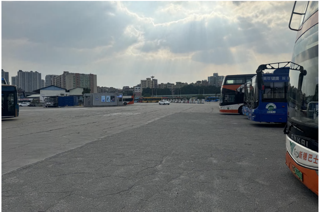
图 25 地块中部、东部现状（东北-西南）