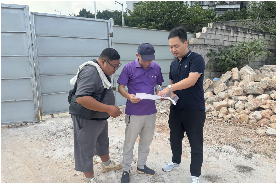
图 14 工作人员现场查看项目红线范围（东南-西北）