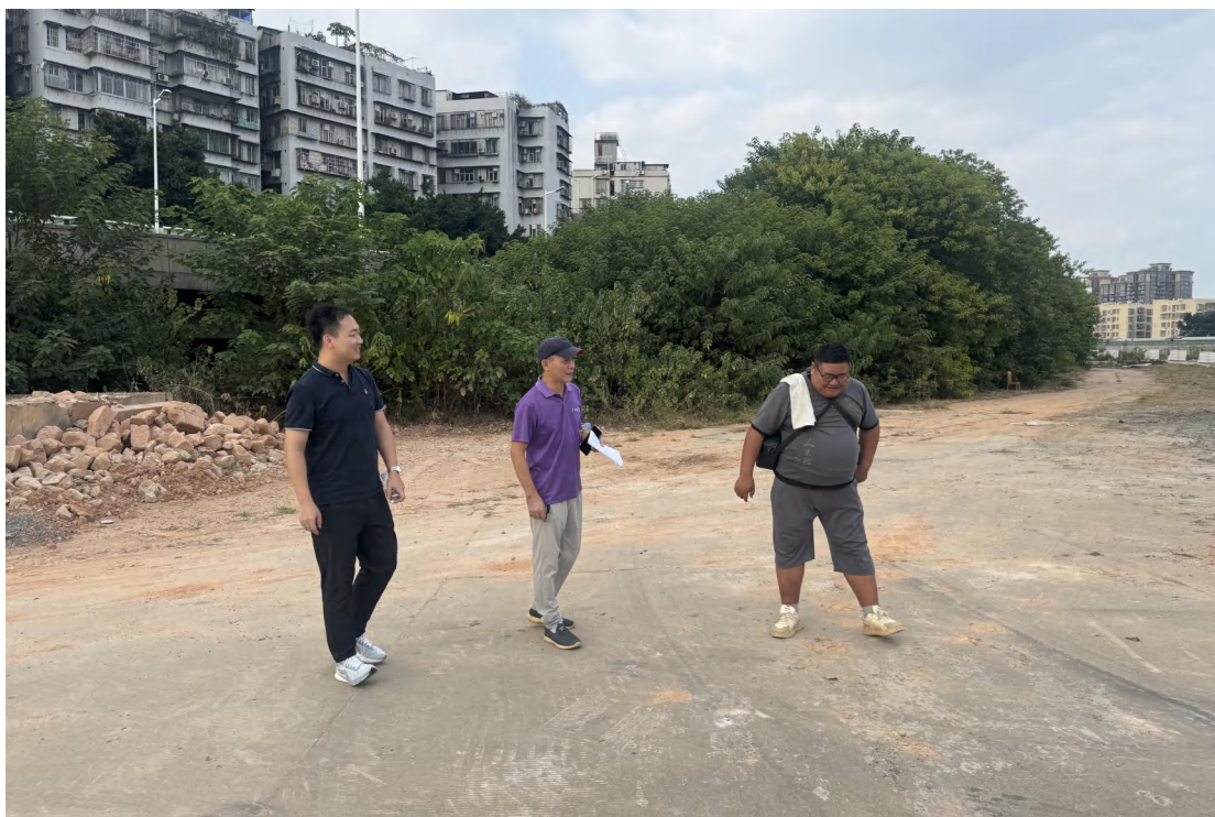
图 15 工作人员现场踏查（南-北）