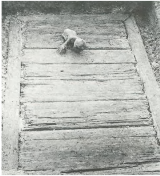
图 11 柳园岗 M11 梓盖