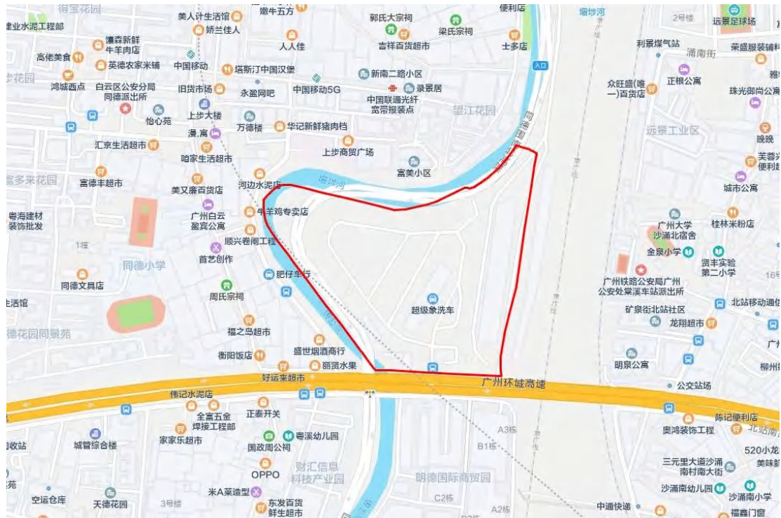
图 3 项目周边位置图