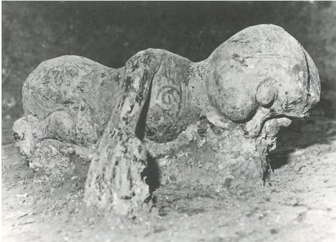
图 13 文身木俑

近年来，考古工作者在该项目周边开展过一系列考古工作，详细情况如下： 2021年3月，对越秀区北站路71号茶叶仓地块商住楼项目进行了考古调查工作，未发现其他古代文化遗存及不可移动文物。