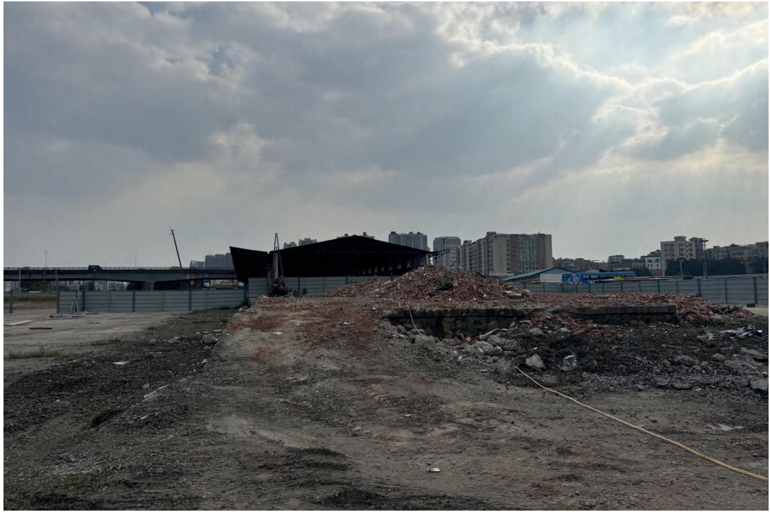
图 20 地块东北部现状（北-南）