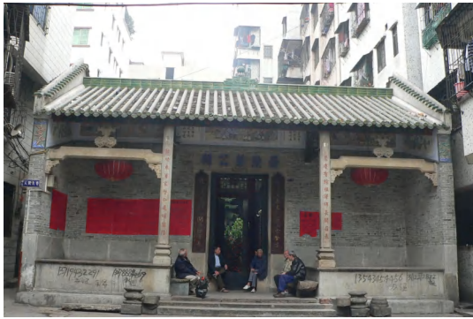
图 9 崇勋蔡公祠

何氏大宗祠 位于矿泉街王圣堂大街 60 号。坐北朝南，面阔三间 12.46 米，深二进 26.6 米，占地面积约为 330 平方米。绿琉璃瓦硬山顶，青砖墙石脚，石檐柱，木金柱，内外墙面贴瓷砖，红色耐磨砖地板，桁瓦下沿祠堂内墙及大门口墙楣配壁画诗词，两组石柱对联，六组木刻对联。