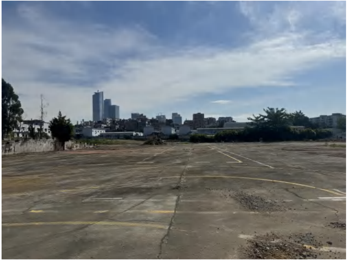
图 30 项目地块中部现状（西-东）