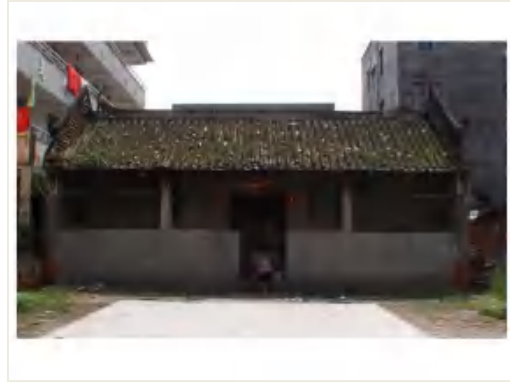
图 7 姚氏宗祠

钟氏祠堂建筑群 位于天园街棠下村儒林大街。始建于清嘉庆二十年（1815）。民国 35 年（1946）起为棠下达善小学校舍。至 20 世纪 70 年代中期，改做厂房。1999 年重修。并排坐东北朝西南，共有 5 座，总阔 120 米，建筑占地面积 3000 多平方米。前有广场，后有庭院。现为天河区文物保护单位。