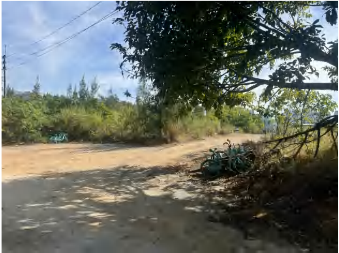
图 24 项目地块西南部现状（西南-东北）