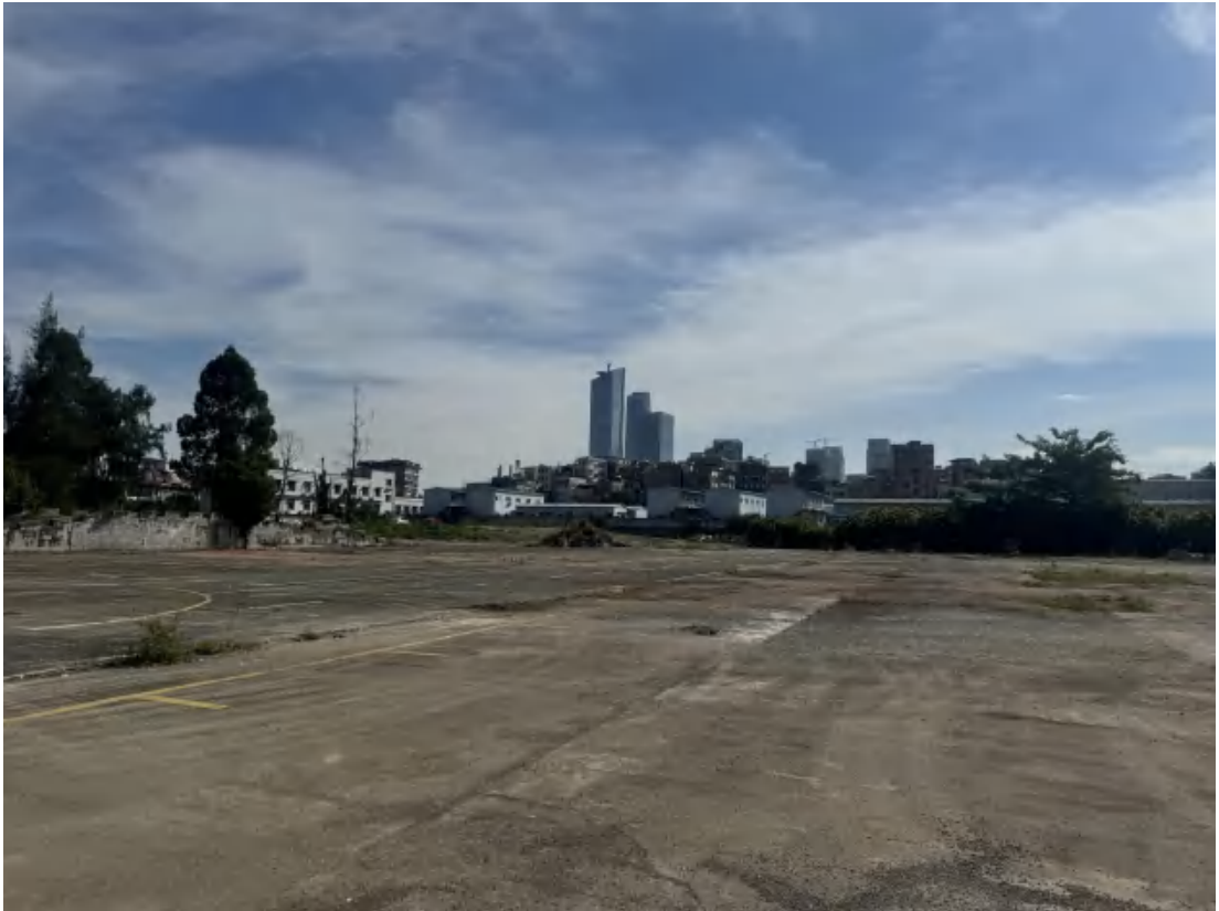
图 27 项目地块中部、东部现状（西南-东北）