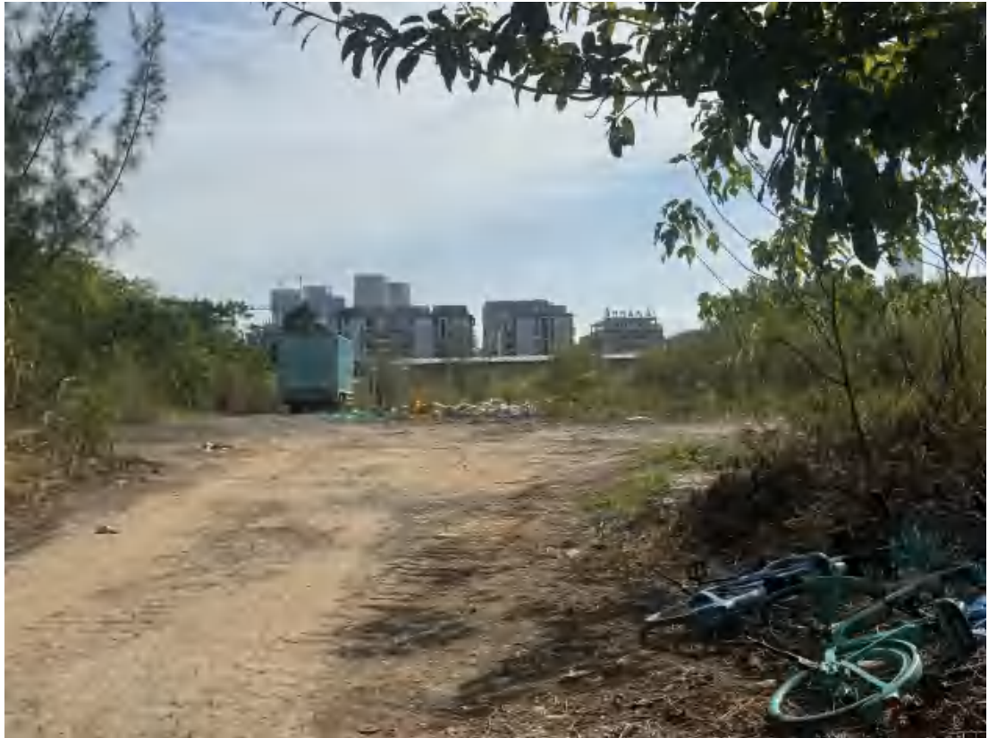
图 17 项目地块南部现状（西-东）