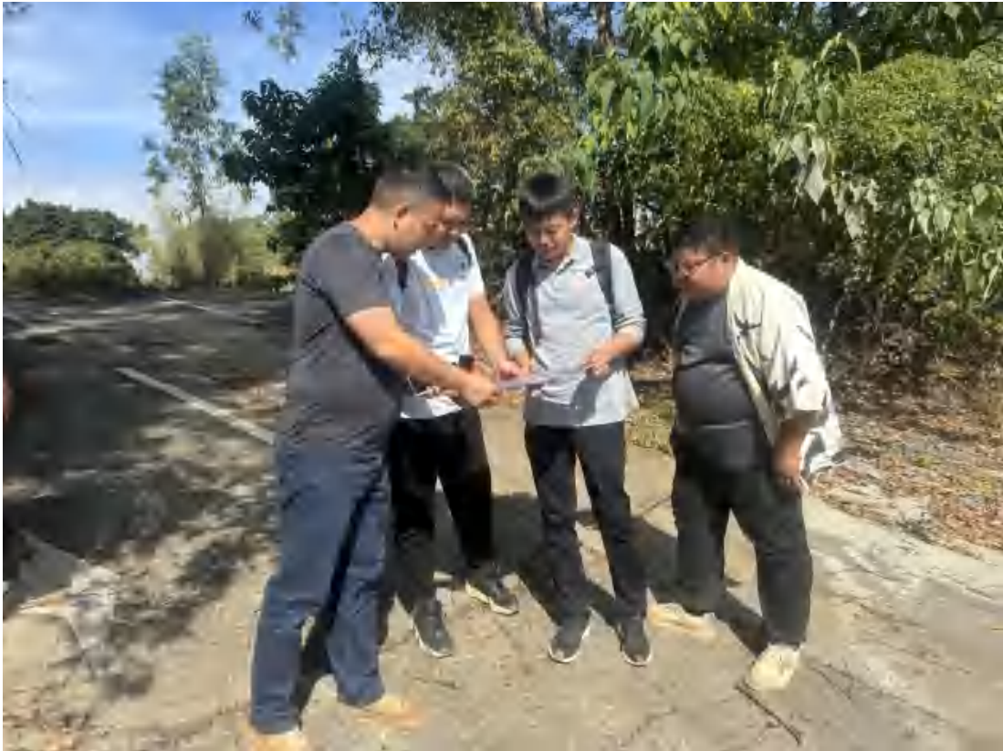
图 13 工作人员核对项目红线范围（西-东）