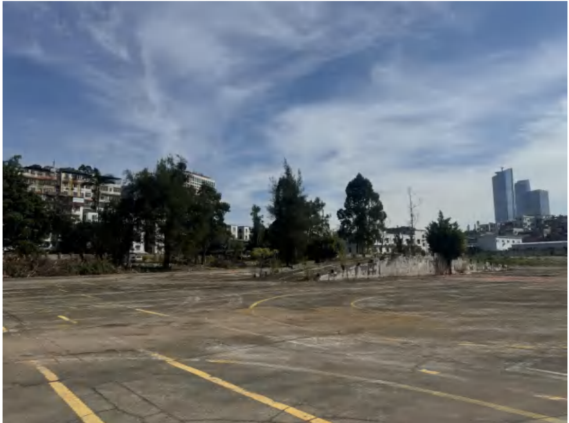
图 15 项目地块北部现状（西南-东北）