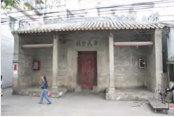
图 10 梁氏宗祠（猎德村）

板麻石接连铺成。每板麻石宽 0.30 米，长 1.5 米，整条石路大部分宽约 6 米（连水泥地）。