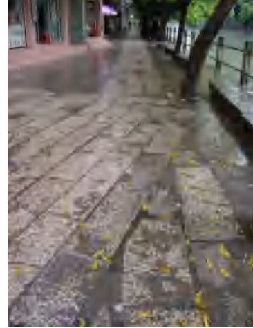
图 11 麻石街（猎德村）

程介东村李氏宗祠 位于员村街道程介东社区居委会程界东村大巷。建于清代。现为天河区登记保护文物保护单位。