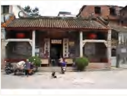
图 6 子富冼公祠