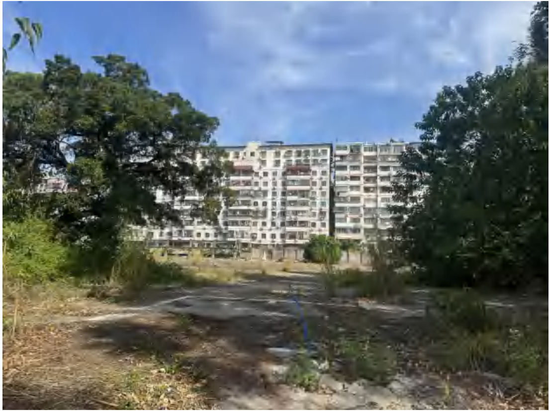
图 20 项目地块西北部现状（南-北）