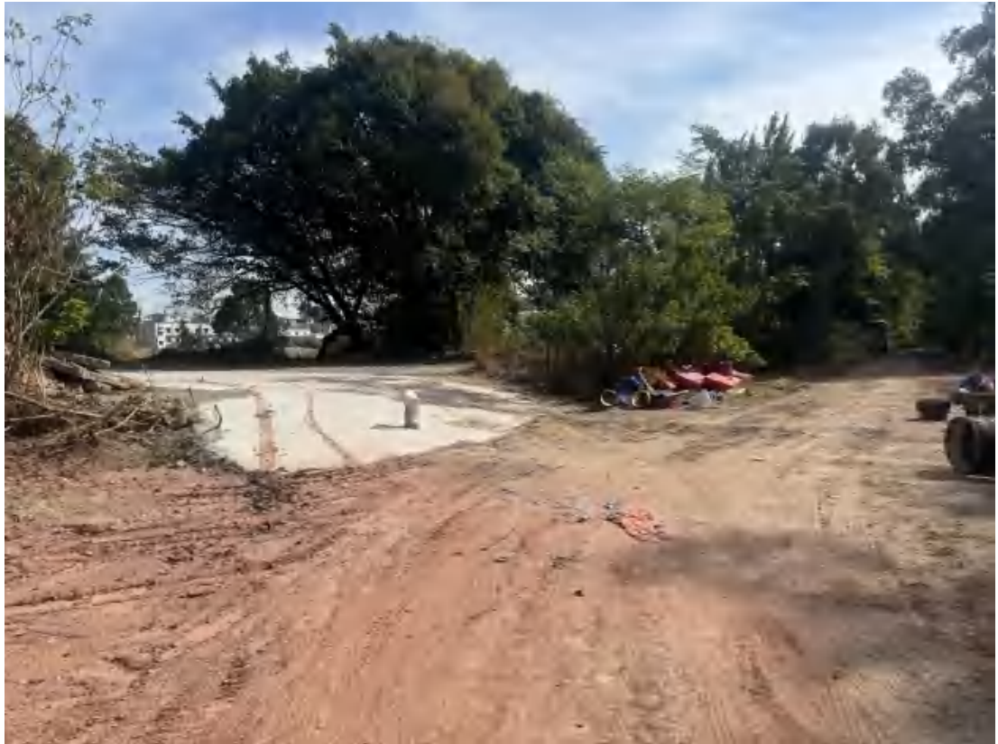
图 31 项目地块中西部现状（西南-东北）