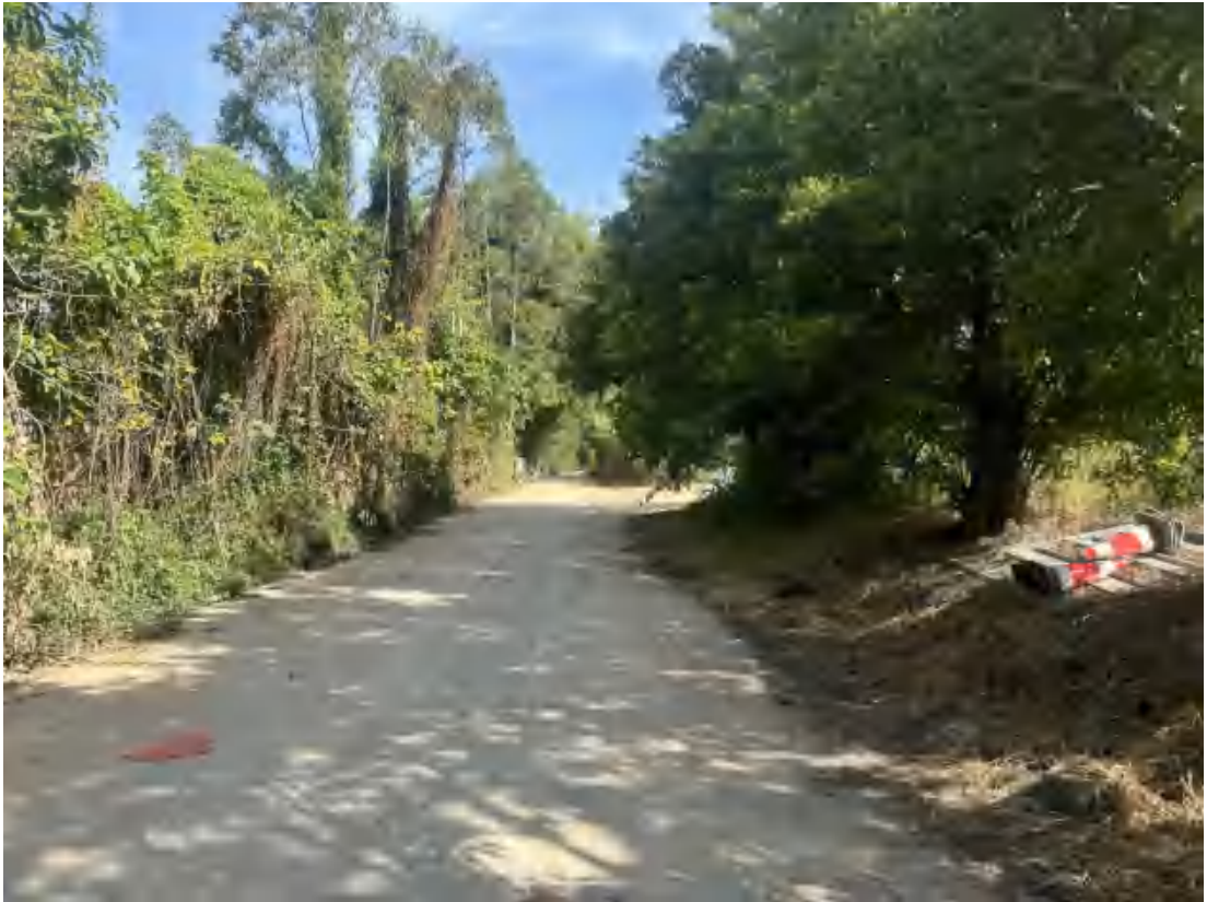
图 23 项目地块西南部现状（南-北）