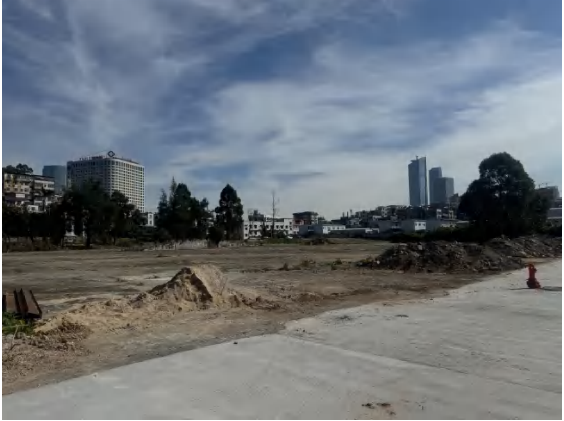
图 26 项目地块中部、东北部现状（西南-东北）