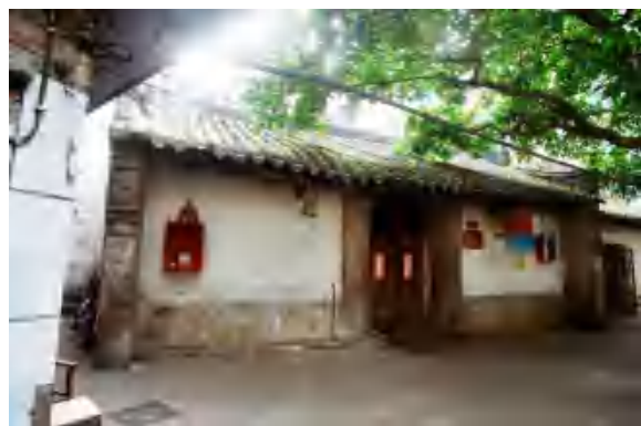
图 9 龙母庙

梁氏宗祠（猎德村） 位于猎德街猎德村西浦大街园艺祠道 1 号，猎德桥西。建于清嘉庆十六年（1811），1990 年重修。坐西朝东，三间两进，总面阔 12 米，总进深 18 米，建筑占地面积共 216 平方米。两进都为硬山顶，博古脊，碌灰筒瓦。前后两进的房屋侧面有山花雕刻。青砖墙，红砂岩石脚。门前有猎德涌。