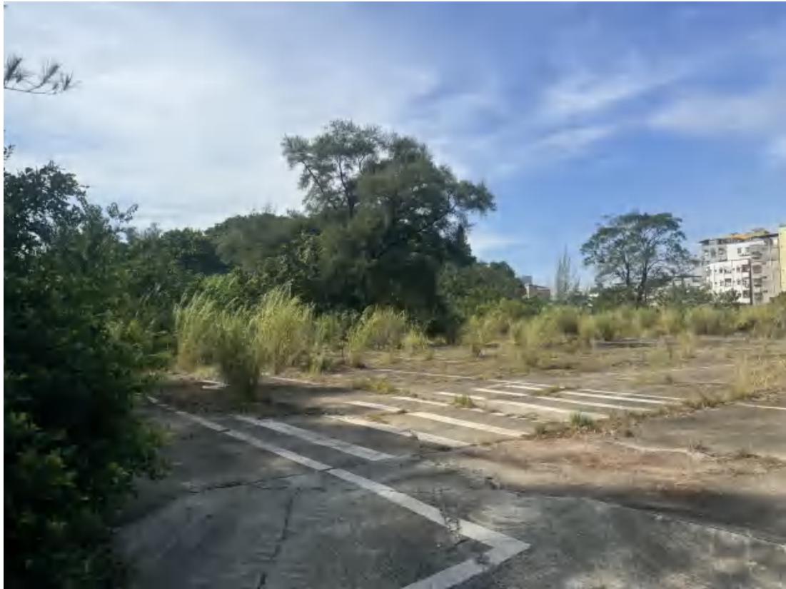
图 18 项目地块西北部现状（东北-西南）