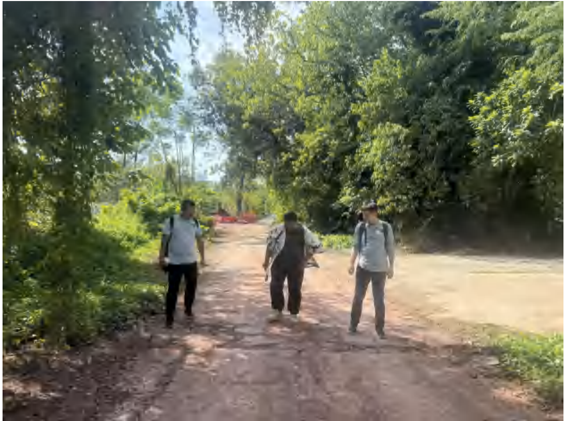
图 14 工作人员现场踏查（北-南）