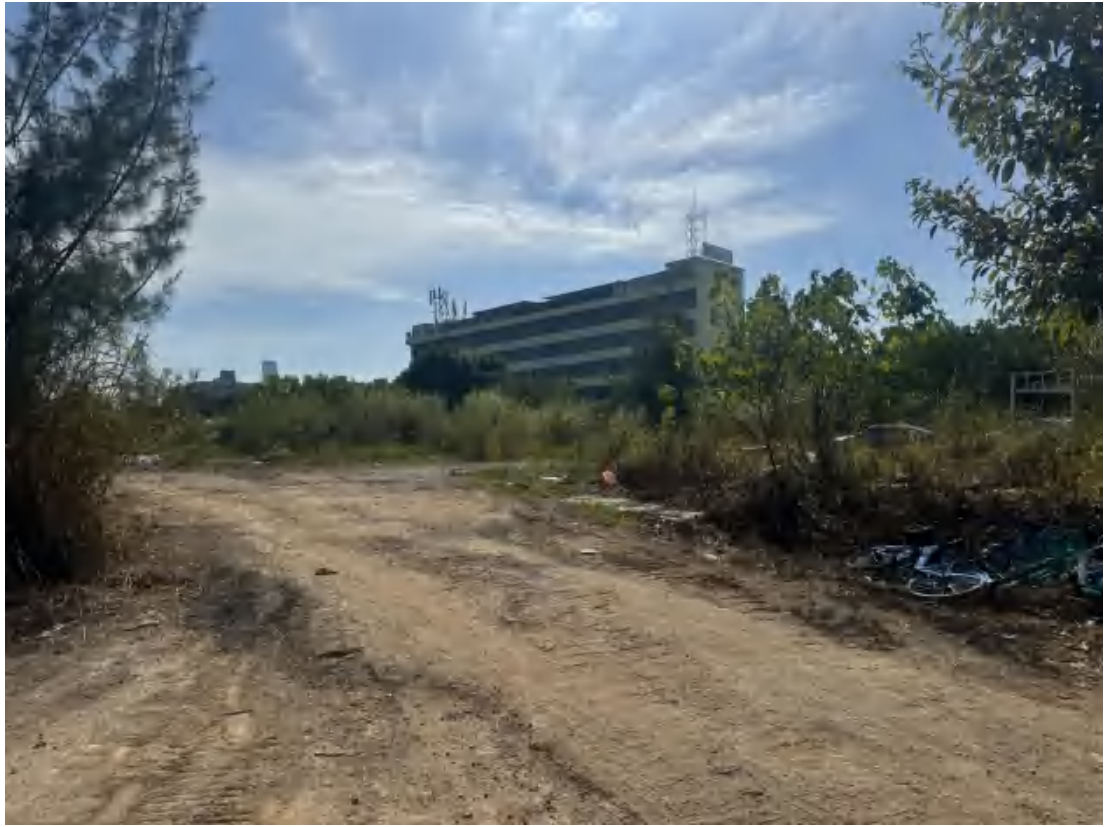
图 16 项目地块南部现状（西北-东南）