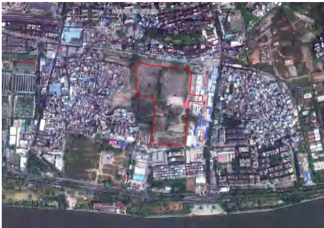
图 4 项目地块卫星影像图（甲方供图）