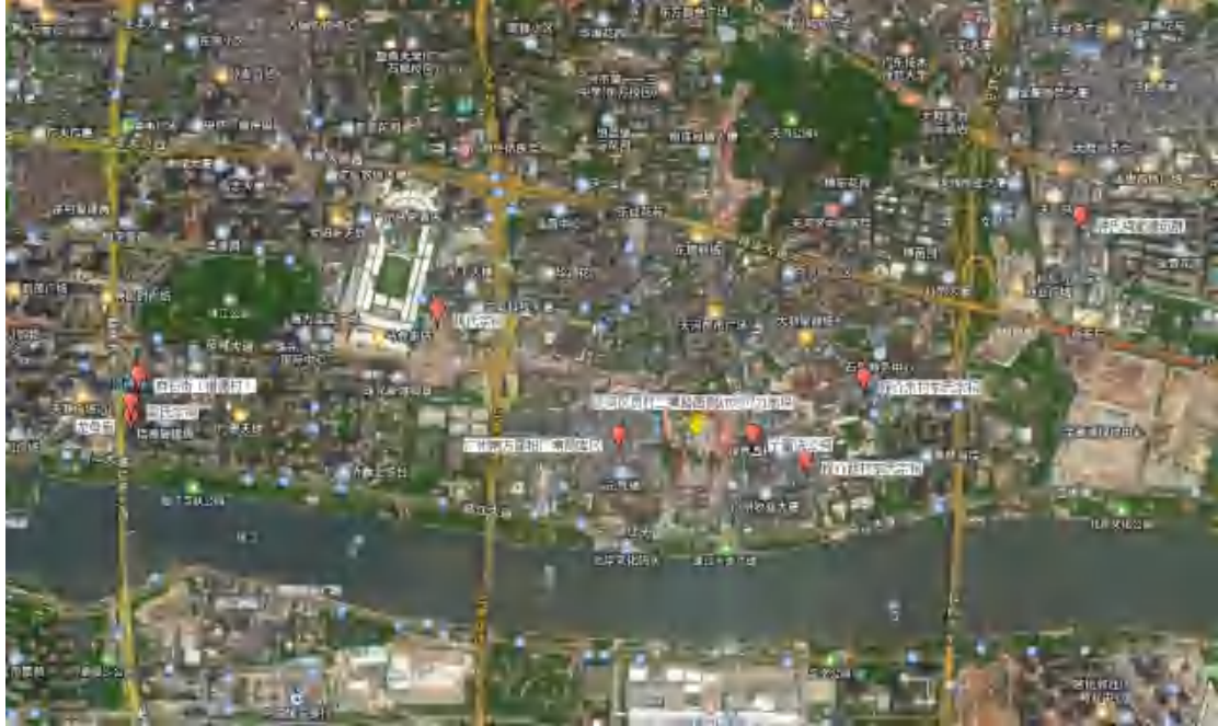
图 5 地块周边文物分布示意图

据资料记载，距离地块较近的文物资源主要有子富冼公祠、姚氏宗祠、钟氏祠堂建筑群、龙母庙、梁氏宗祠（猎德村）、麻石街（猎德村）等，介绍如下：