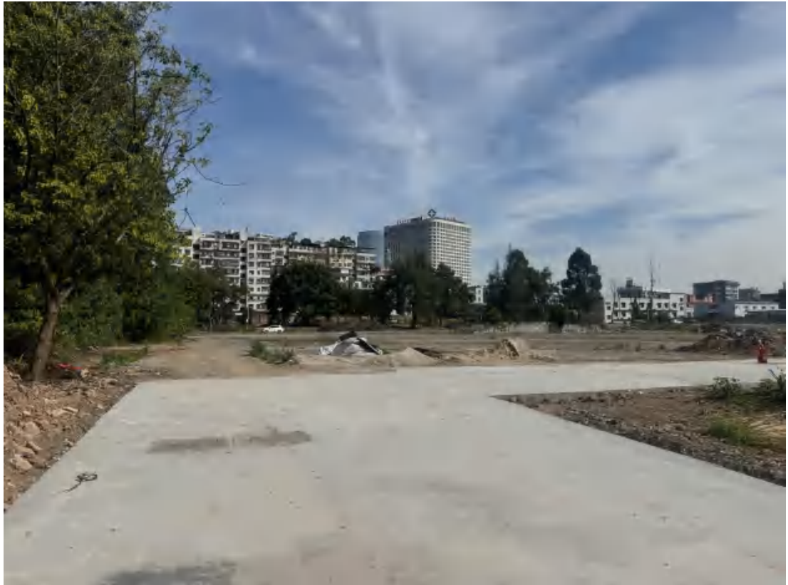
图 25 项目地块中部、北部现状（南-北）