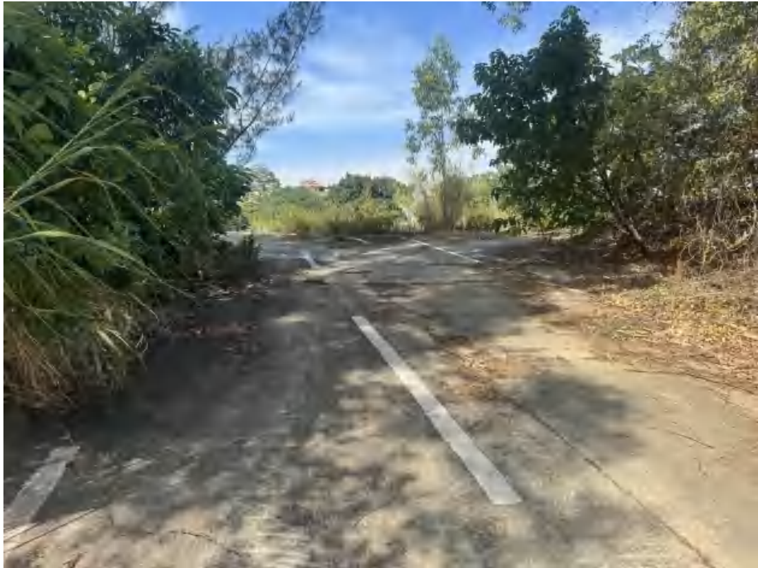
图 19 项目地块西北部现状（东-西）