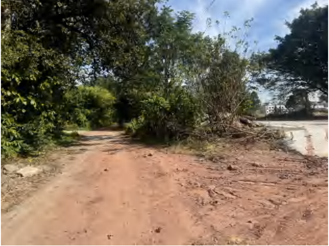
图 22 项目地块西部现状（南-北）