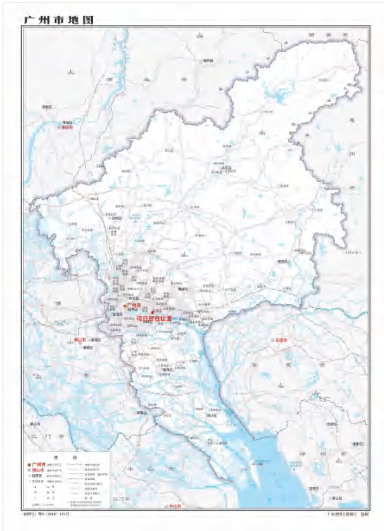
图 1 项目在广州市位置示意图（标准地图）

根据《中华人民共和国文物保护法》《广州市文物保护规定》，按照《广州市文物局关于天河区员村二横路西侧 AT080721 地块考古调查勘探工作的复函》（文物 20241084 号）的指导意见，受广州市土地开发中心委托，由我院负责该项目的考古调查工作。