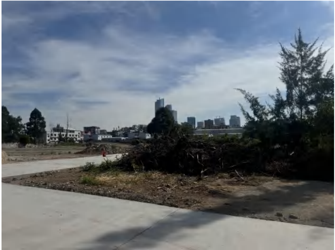
图 29 项目地块中部现状（西-东）