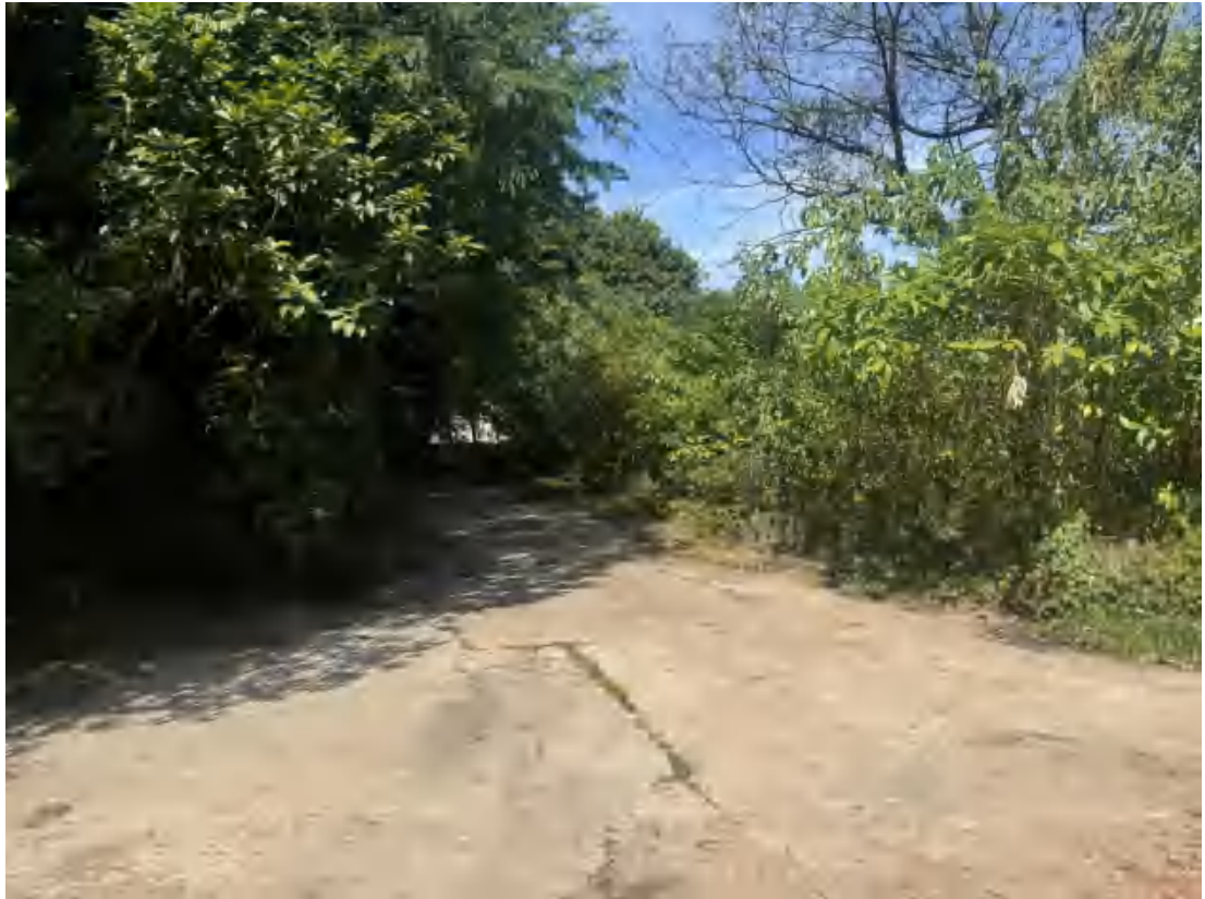
图 21 项目地块西部现状（南-北）