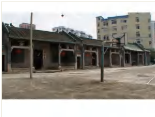
图 8 钟氏祠堂建筑群

龙母庙 又称龙母宫、大庙，位于猎德街猎德村东南大街 7 号。始建年代不详，自清康熙三十二年（1693）至光绪十五年（1889）曾五次重修。坐东南朝西北，三间两进，总面阔 9 米，总进深 25 米，建筑占地面积 225 平方米。前后两进均为硬山顶，锅耳山墙，屋顶平缓，灰塑龙船脊，碌灰筒瓦，绿琉璃瓦当剪边，青砖石脚。现为广州市登记保护文物单位。