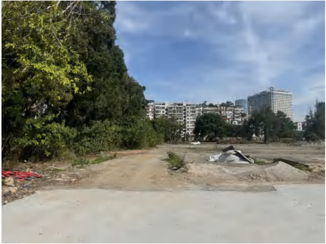
图 28 项目地块中部现状（南-北）