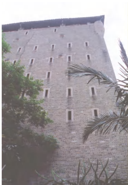
图 6 平和大押

平和大押旧址： 位于均和墟的南面，当年是禺北地区最有名的当铺，建于民国十七年（1928年），老板是石井滘心人。该当铺坐东朝西，面阔 24.72 米，纵深 40.59 米，占地面积 1003.38 平方米。由主体建筑包括前座平房的营业铺面和后座碉楼状的仓库以及南北侧院、东面后院组成。前座平房面阔三间 13.5 米，其中凹门斗面阔 4.5 米，进深三间 16 米，其中凹门斗面阔 0.8 米，硬山顶，人字山墙，平脊，碌灰筒瓦，陶瓦剪边。前座与碉楼式仓库之间，挖有一条水渠，宽 3.6 米，长 14 米，当地人俗称之为“护城河”。碉楼式仓库面阔三间 14 米，进深三间 14.3 米，楼高 38 米（至碉楼瓦脊计），地面计起共分 9 层。前座平房面阔三间 13.5 米，其中凹门斗面阔 4.5 米，进深三间 16 米，其中凹门斗面阔 0.8 米，硬山顶，人字山墙，平脊，碌灰筒瓦，陶瓦剪边。2019 年 4 月，公布为广东省第九批登记保护文物保护单位。