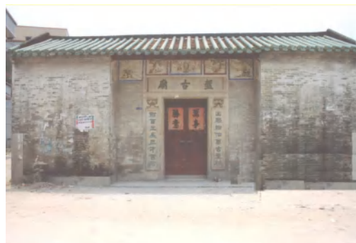
图 11 盘古庙