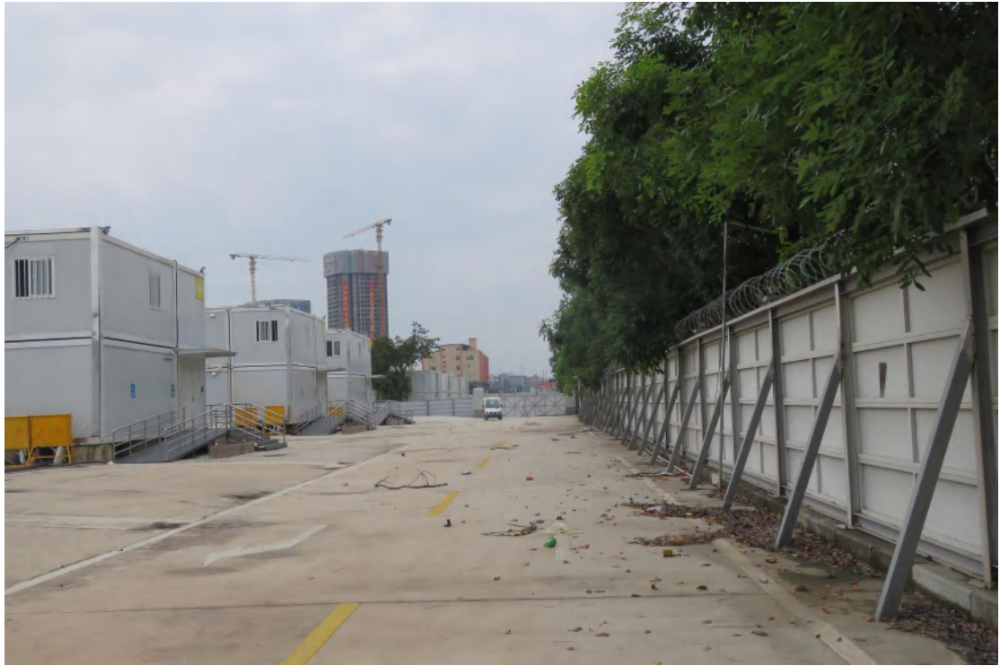
图 25 地块地表现状（北-南）