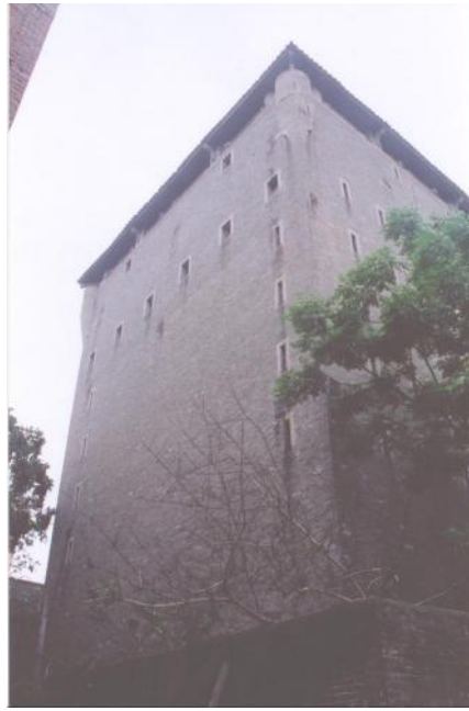
图 7 平和大押

石马陈氏宗祠： 位于均禾街石马村中约，是该村陈姓族人的太公祠堂，始建于清光绪二十二年（1896 年），建国后曾局部修葺。该祠坐西朝东，三路三进，两侧有衬祠，以青云巷相隔，总面阔 24 米，通深 35.5 米，占地面积约 852 平方米。2005 年 9 月，公布为广州市第二批登记保护文物保护单位。