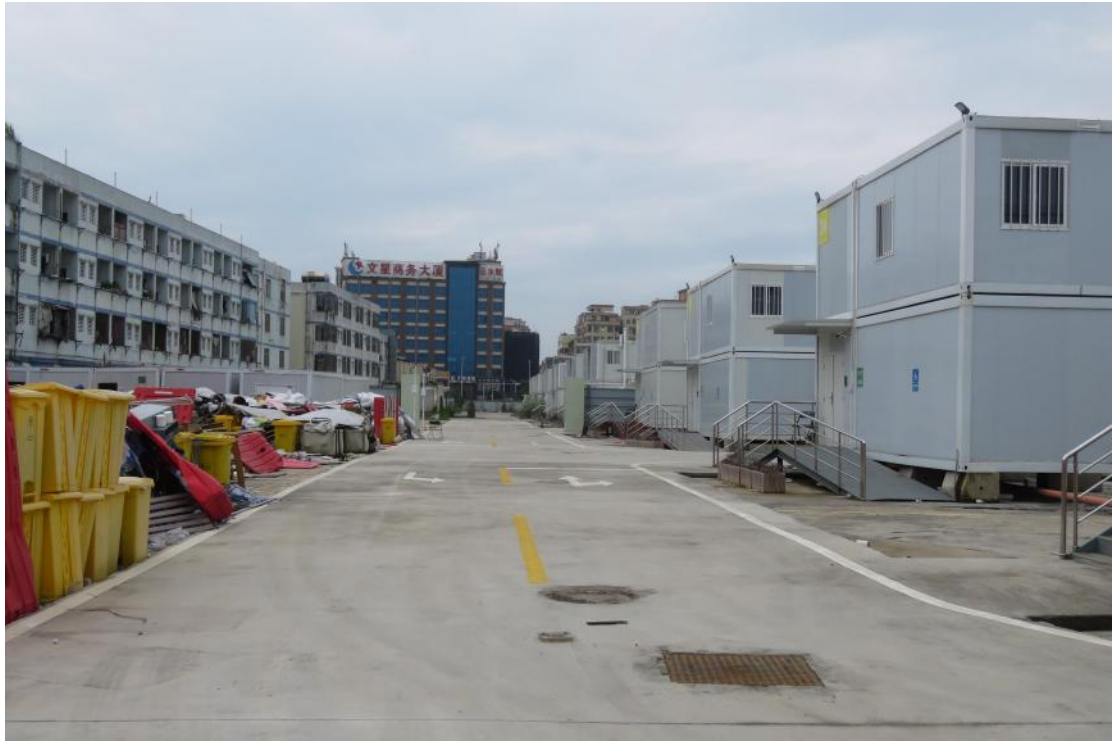
图 23 地块地表现状（北-南）