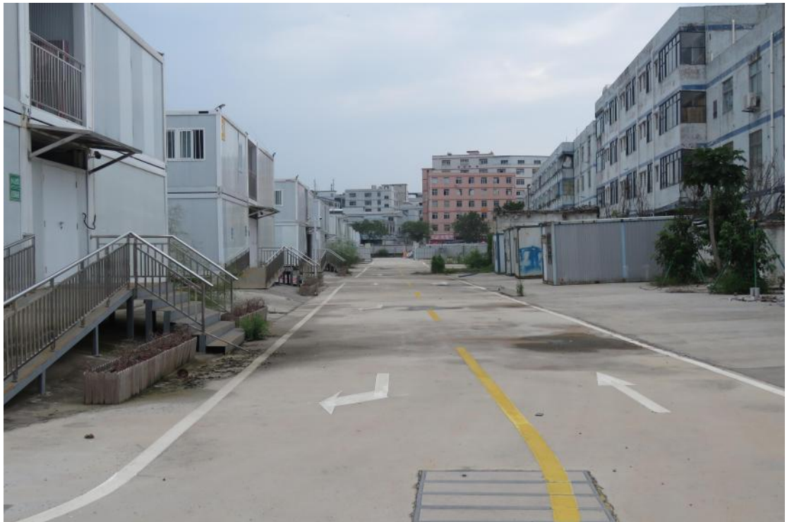
图 18 地块地表现状（北-南）