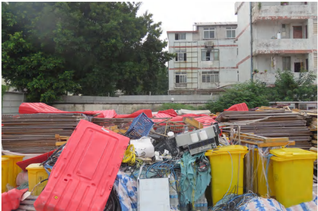
图 20 地块地表现状（东-西）