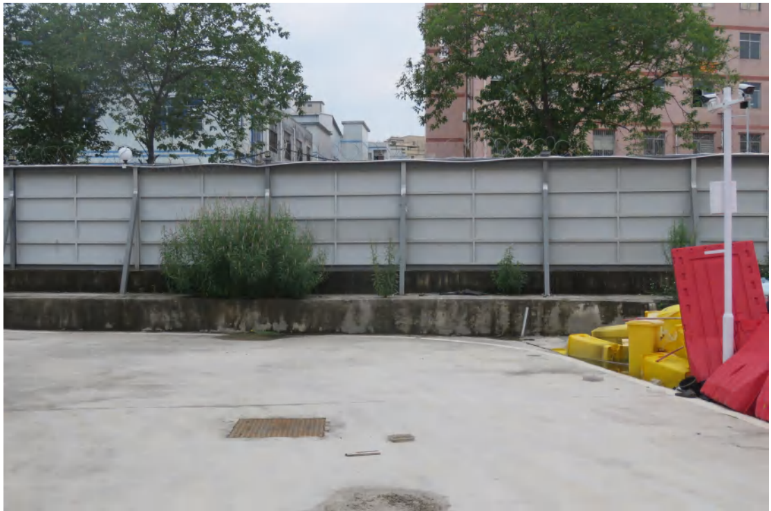
图 22 地块地表现状（北-南）