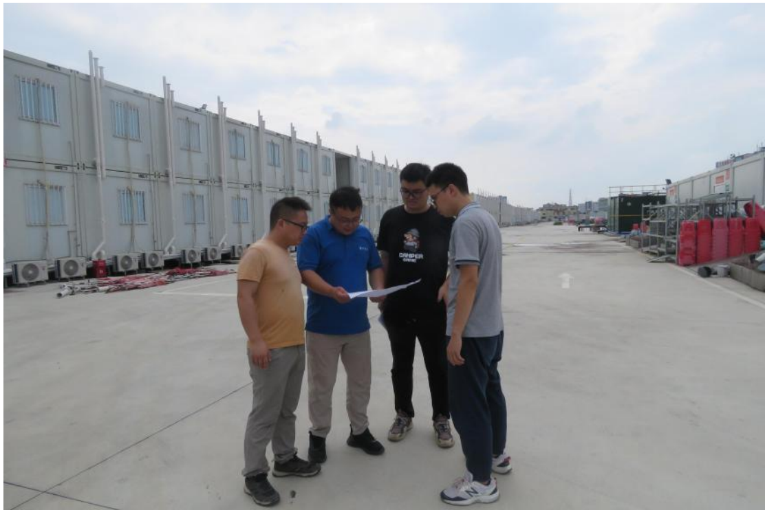
图 14 与工作人员确定地块范围（东-西）