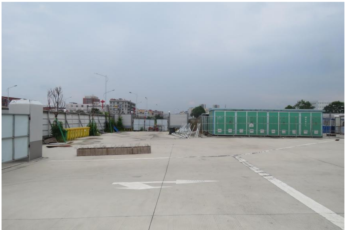
图 26 地块地表现状（西-东）