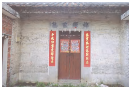
图 13 锦辉家塾