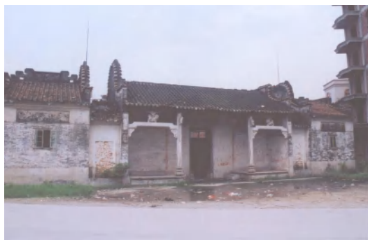
图 8 石马陈氏宗祠

陈文盛带侄子陈正君，从广东五华县万塘大河背村来长湓定居。故相传宗祠始建于康熙年间，原用泥砖砌墙，因年久失修而被拆除。光绪 13 年（1887 年）迁址重建，曾于 2001 年重修。该祠坐东朝西，广三路，中路为正祠，左右为衬祠，均以青云巷相隔。青云巷石门额上分别阴刻“叶茂”、“根深”。总面阔 23 米，深二进，通深 28 米，占地面积 644 平方米。2010 年 12 月，公布为白云区第二批登记保护文物单位。