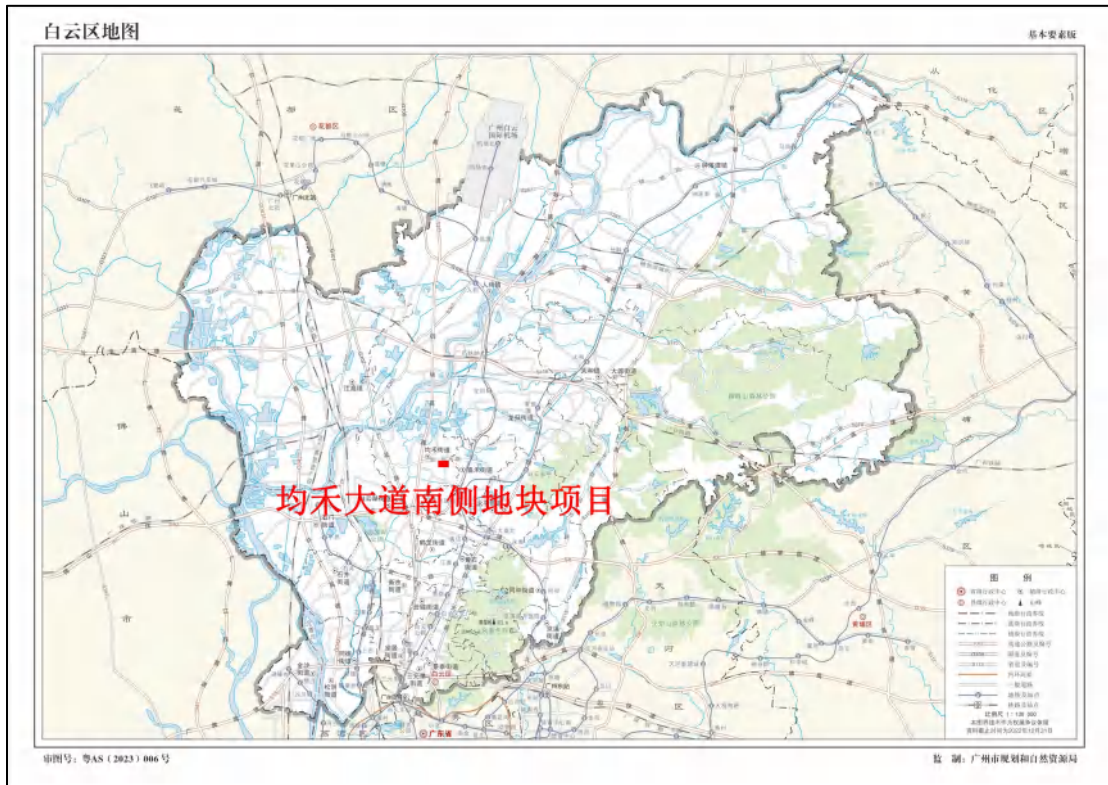
图 2 项目地块在白云区的位置示意图（广州市规划和自然资源局）