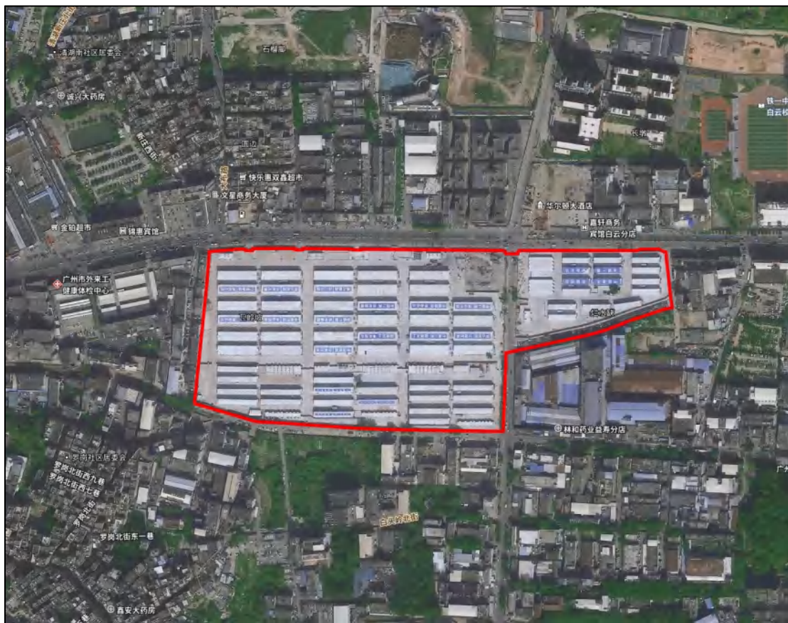
图 3 项目地块卫星红线示意图