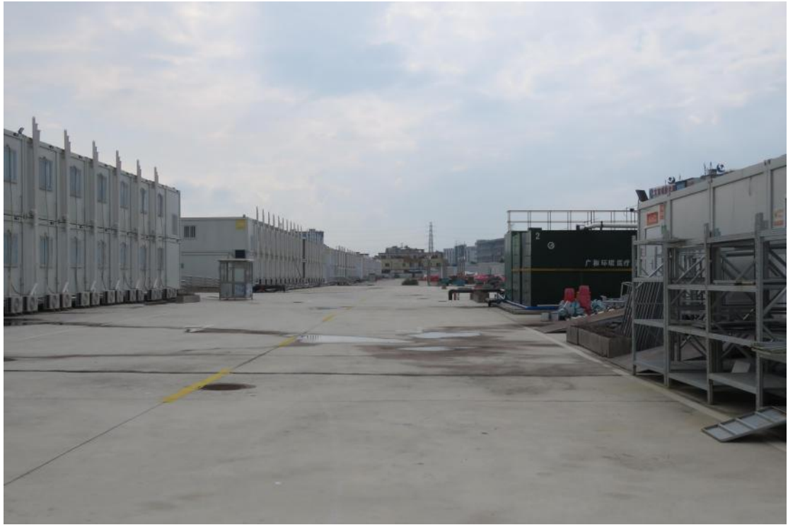
图 15 地块地表现状（东-西）