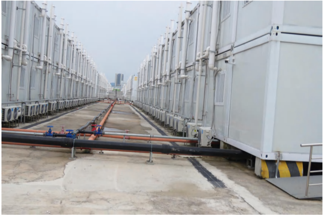
图 19 地块地表现状（西-东）