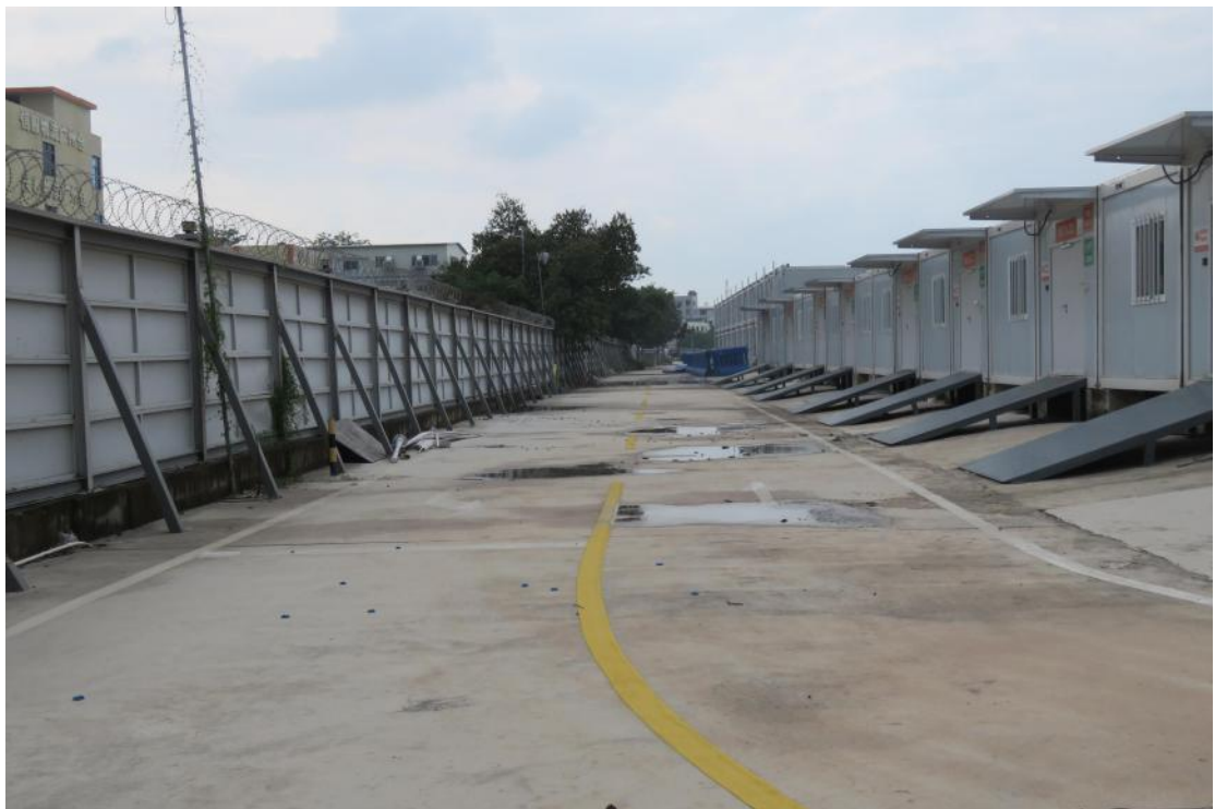
图 24 地块地表现状（南-北）