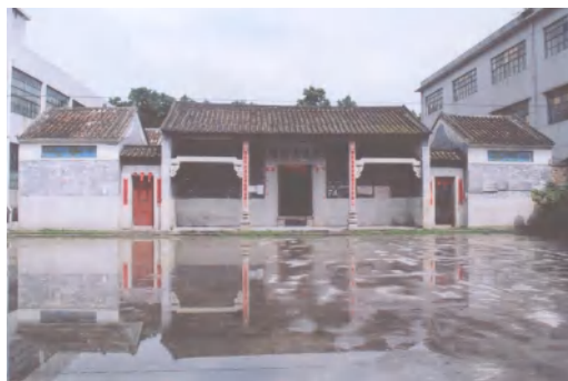
图 9 陈氏大宗祠

仙师宫： 位于均禾街长湓村南边街，是当地民间神庙。该宫于 1925 年拆除，在原址上重建。门前有一混凝土地坪，两边有古榕，已有二三百年的树龄（已列入古树保护之列）。该宫坐北朝南，广三路，总面阔 21 米，左右有衬祠，以青云巷相隔，青云巷石额分别刻有“物阜、民康”；深二进，通深 13 米，占地面积 273 平方米。2010 年 12 月公布为白云区第二批登记保护文物单位。