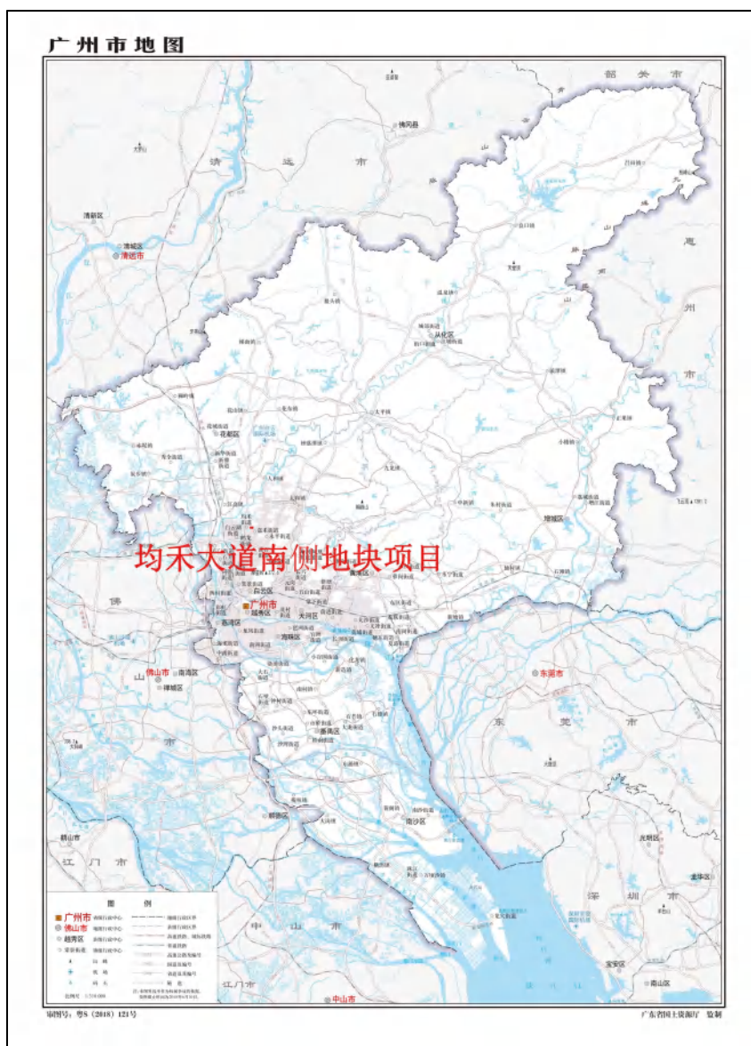
图 1 项目地块在广州市的位置示意图（广东省国土资源厅）

根据《中华人民共和国文物保护法》《广州市文物保护规定》，按照《广州市文物局关于均禾大道南侧地块考古调查勘探工作的复函》（文物 20231044 号）的指导意见，受广州市白云区土地开发中心委托，由我院配合该地块出让，对该项目地块进行考古调查工作。