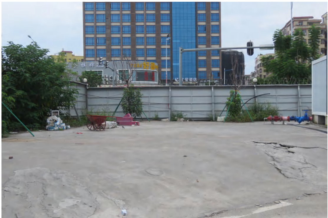
图 16 地块地表现状（东-西）