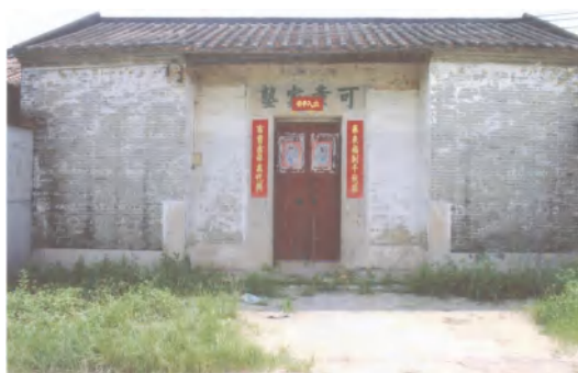
图 12 可章家塾

可章家塾： 位于均禾街长红村双和西街六巷与七巷之间。据云，该家塾与邻近的锦辉家塾同期建成，原系该村周姓族人办学的场所。该家塾坐北朝南，一路二进，面阔 10 米，通深 18 米，占地面积 180 平方米。该家塾保存尚好。现作族人喜庆筵席场所。2010 年 12 月公布为白云区第二批登记保护文物保护单位。