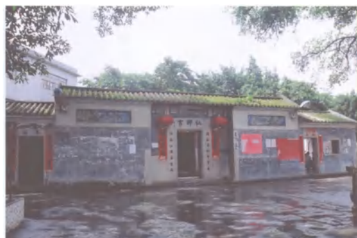
图 10 仙师宫

盘古庙： 位于均禾街长红村竹仔园大街 67 号，是供奉盘古之神庙。始建年代不详，清朝光绪 16 年（1890 年）曾重修。该庙座东朝西，一路二进，面阔 9.8 米，通深 13.3 米，占地面积 130 平方米。硬山顶，人字山墙，灰沙碌筒，绿琉璃瓦剪边，青砖墙，花岗岩石脚。2010 年 12 月公布为白云区第二批登记保护文物单位。