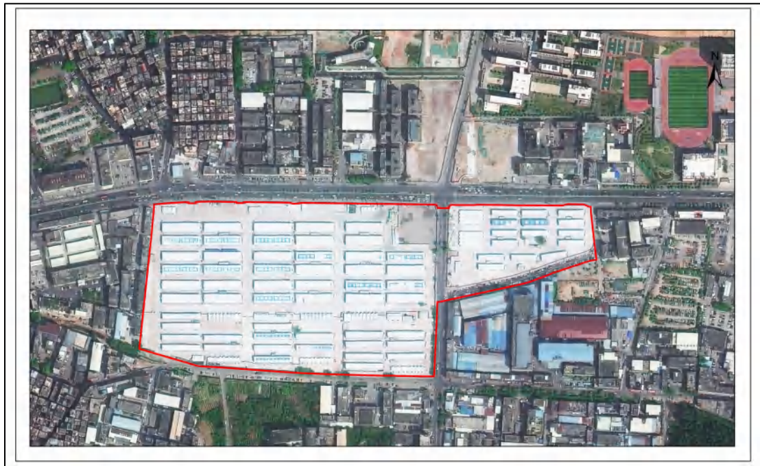
图 5 项目地块红线影像图（业主单位提供）