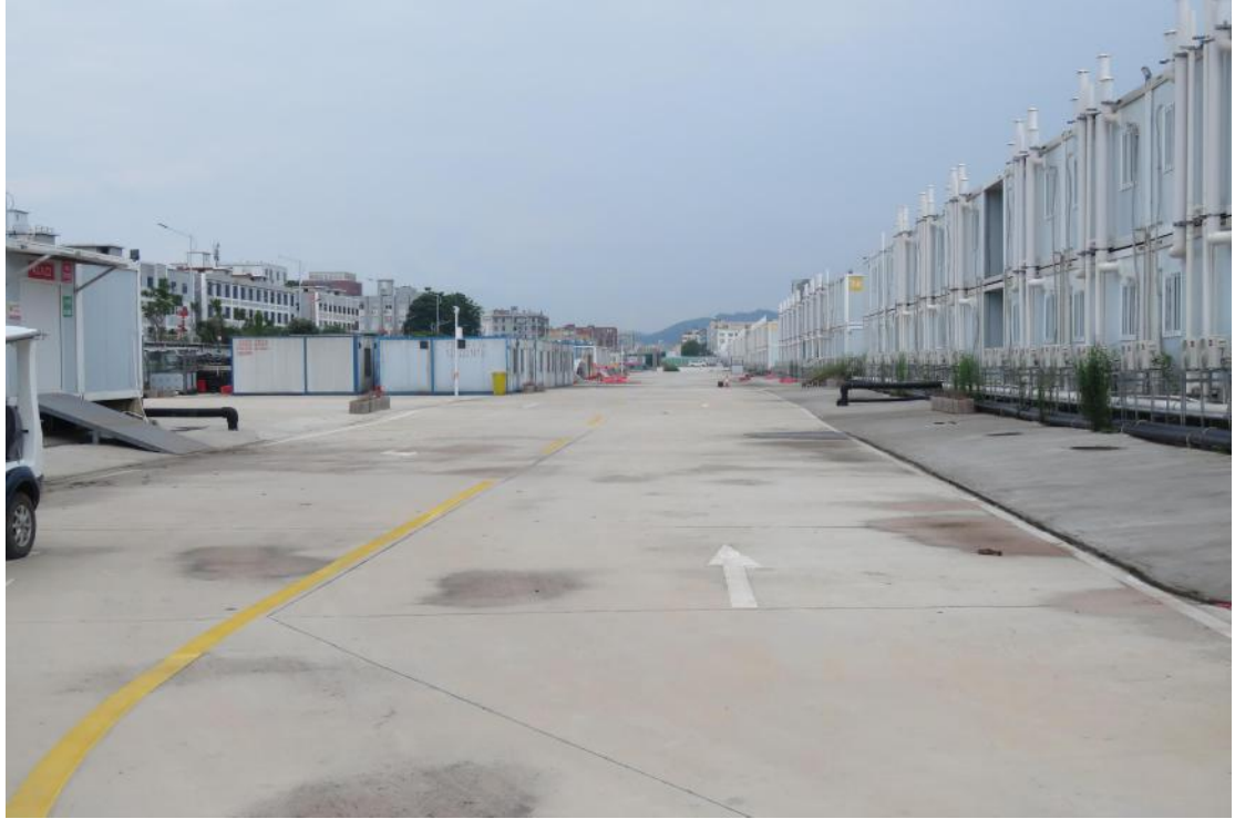
图 17 地块地表现状（西-东）