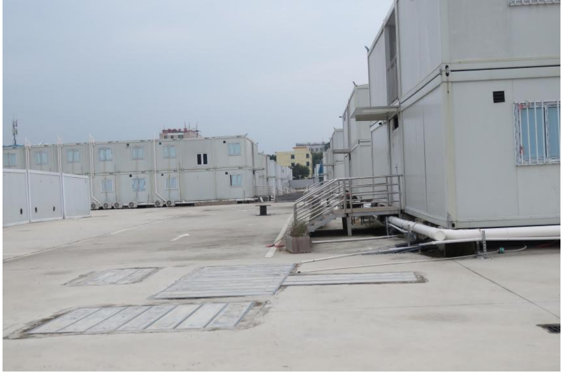
图 21 地块地表现状（西-东）