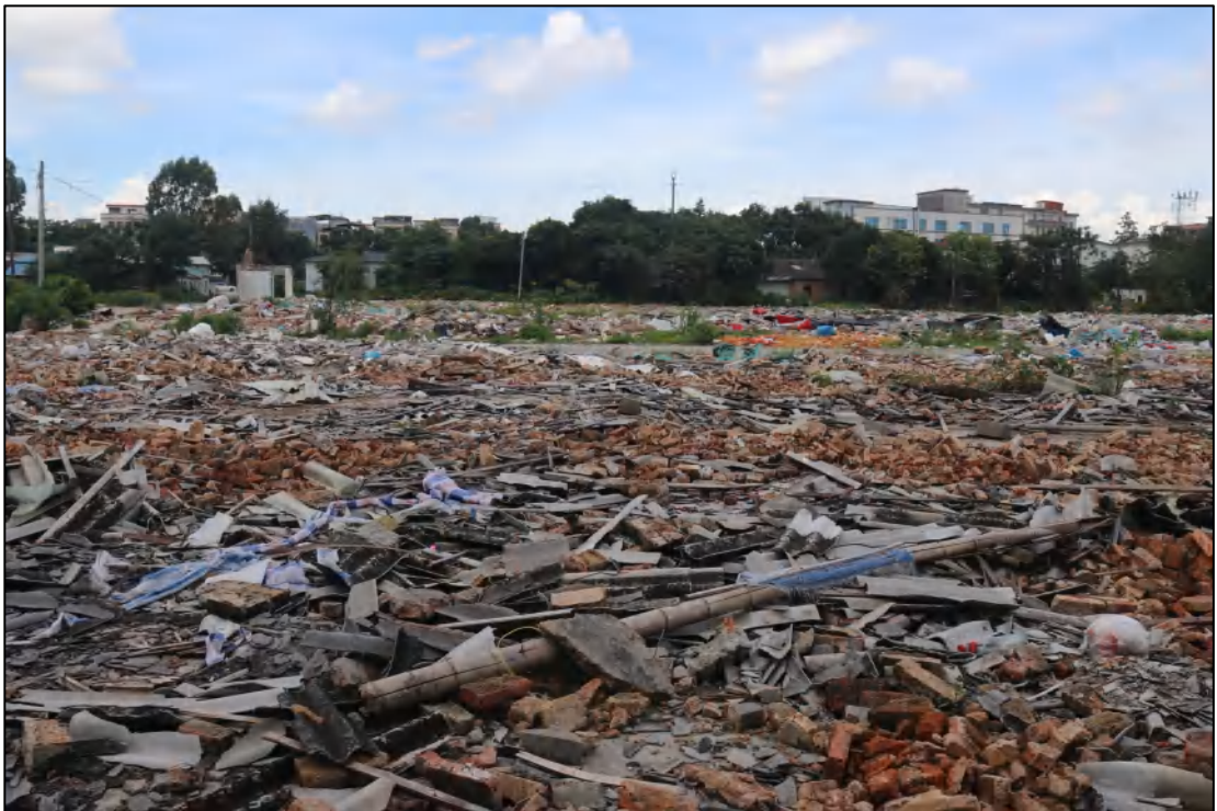
图 11 项目地块现状（东-西）