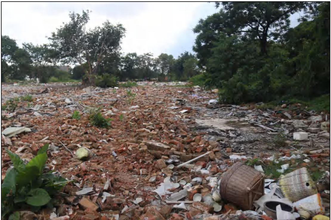
图 13 项目地块现状（南-北）