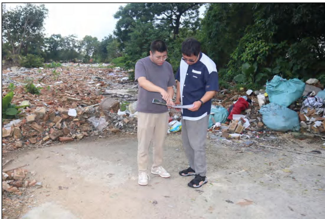
图 5 考古工作人员现场查看图纸（南-北）