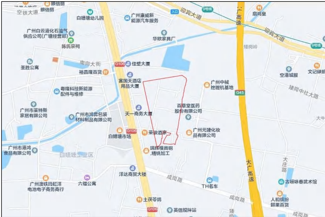
图 3 项目地块周边位置图（腾讯地图）