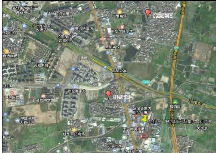
图 4 项目地块周边不可移动文物分布示意图（腾讯卫星地图）

根据《广州市文物普查汇编·花都区卷》所收录，该地块内的文物资源有 2 处：陈氏宗祠、禘兴刘公祠。