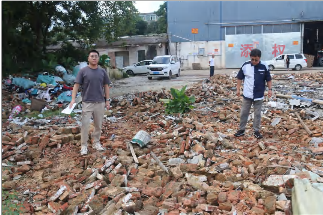
图 6 考古工作人员现场踏查（北-南）