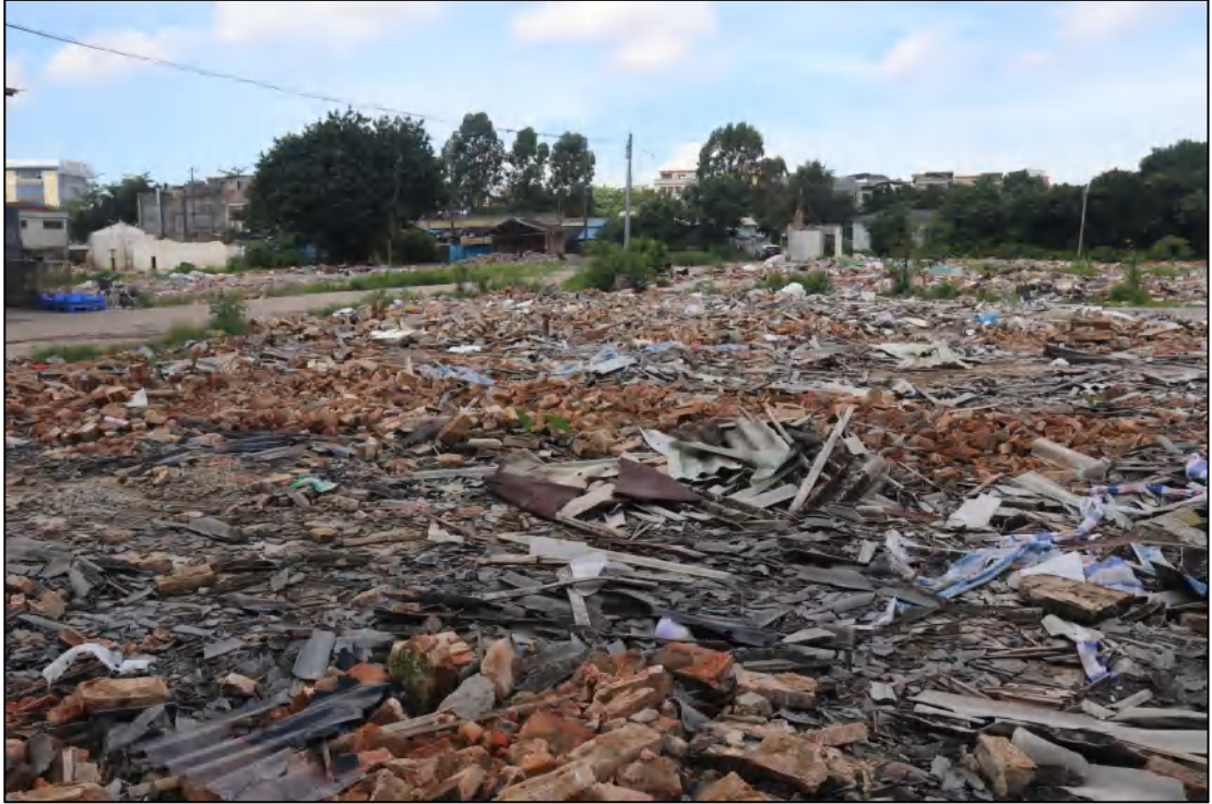
图 8 项目地块现状（北-南）