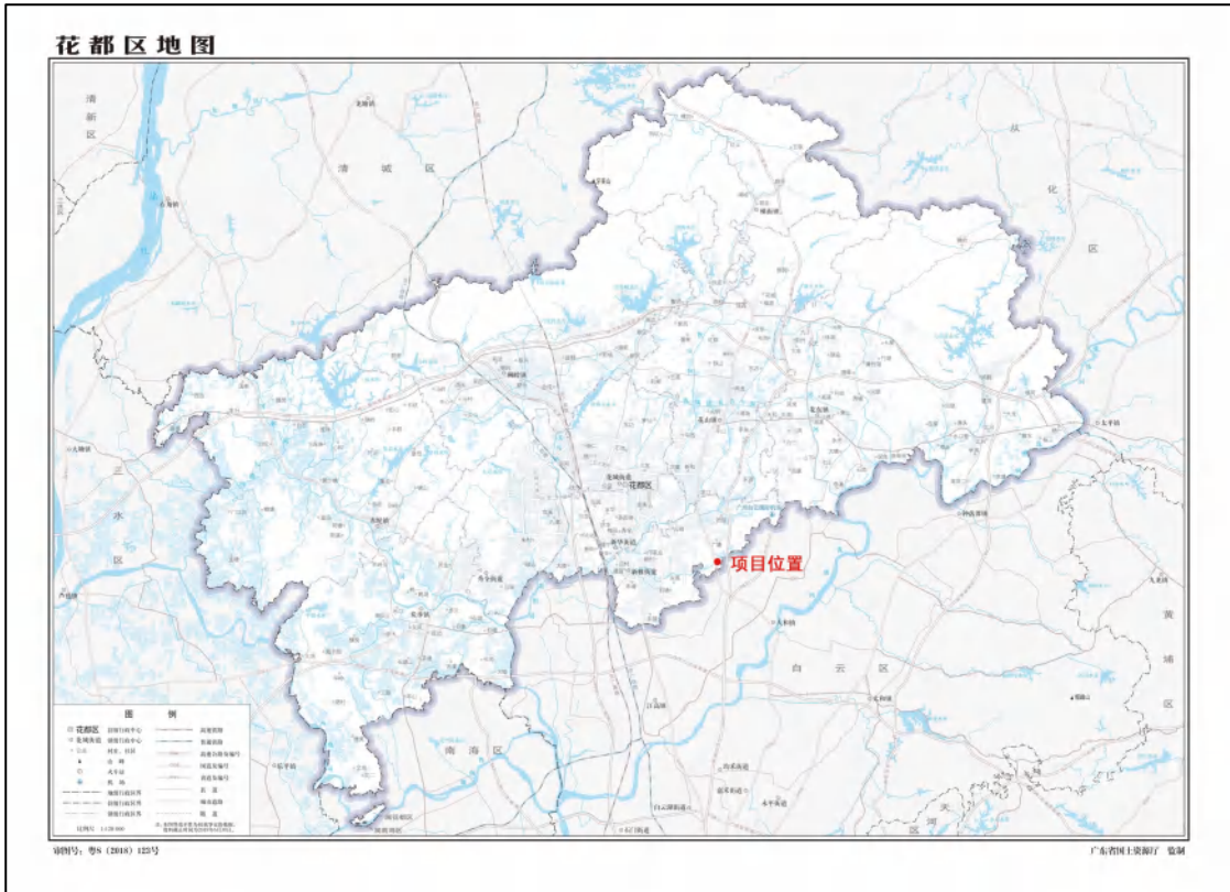
图 2 项目地块在花都区位置（广东省国土资源厅）