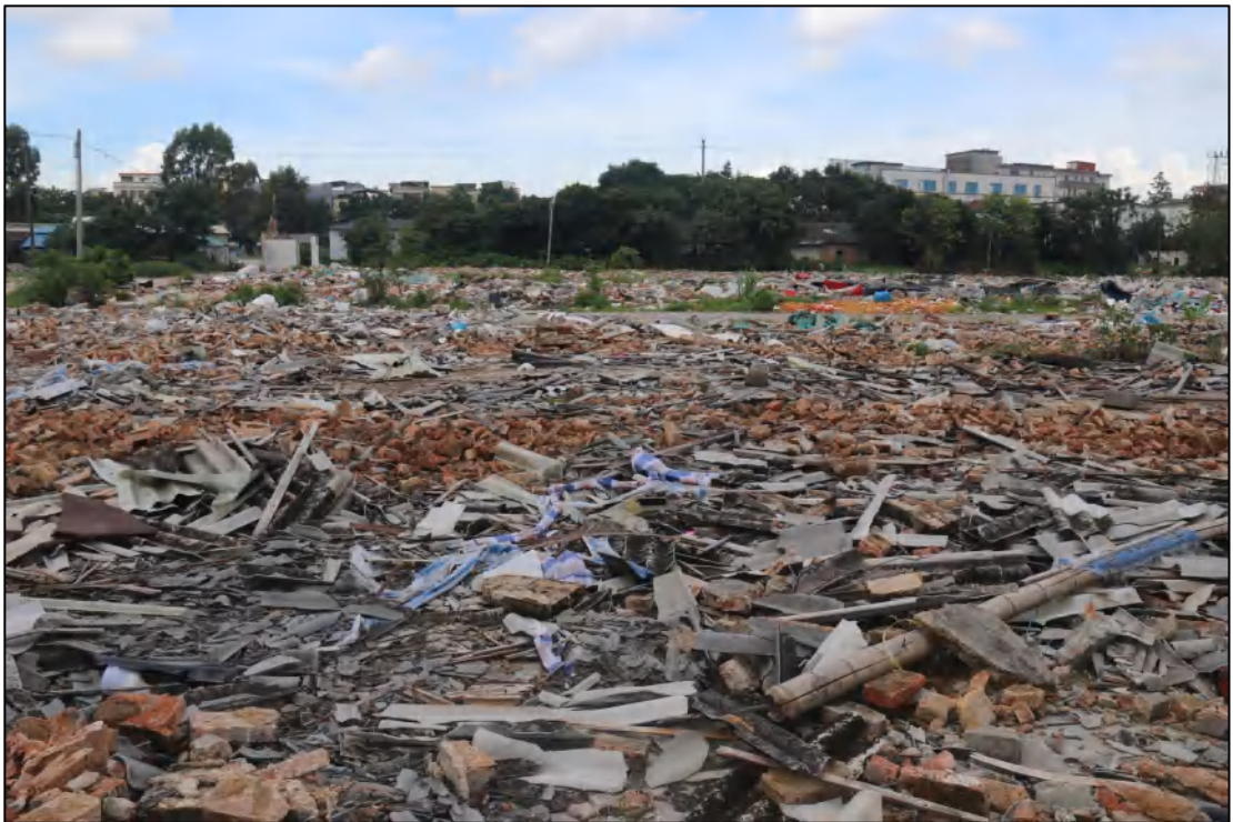
图 9 项目地块现状（东-西）