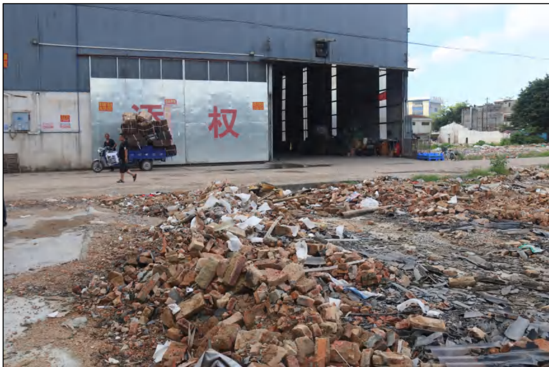
图 7 项目地块现状（北-南）