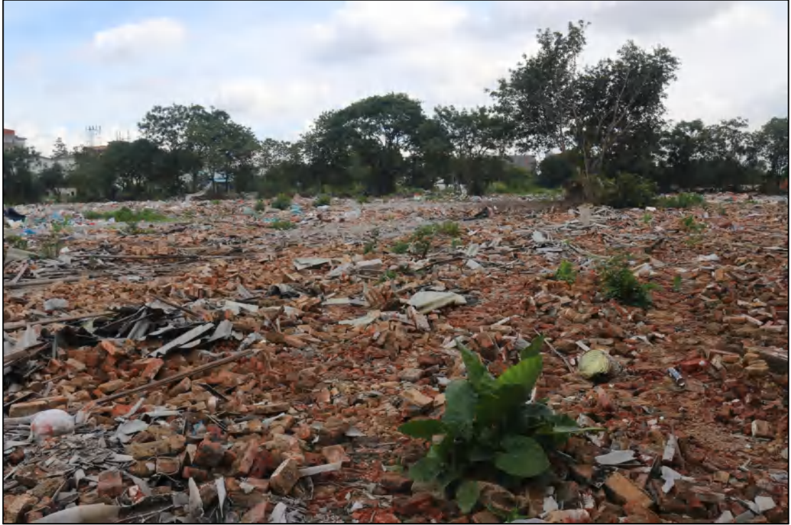
图 12 项目地块现状（南-北）