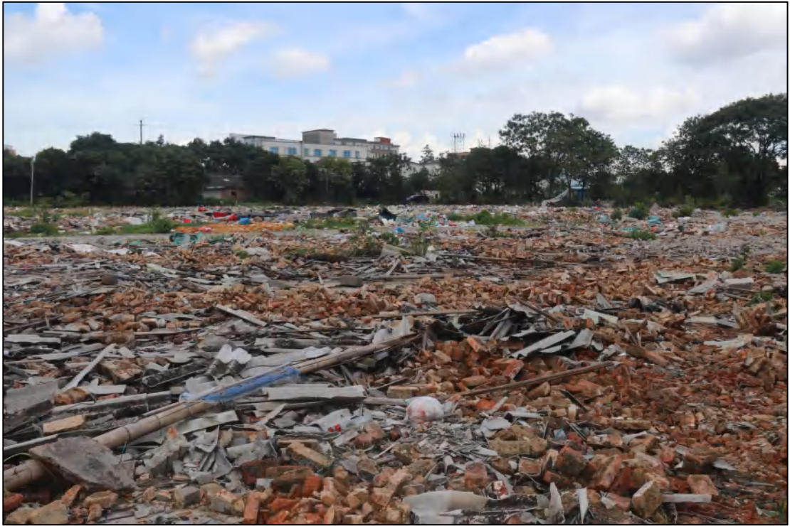
图 10 项目地块现状（东-西）