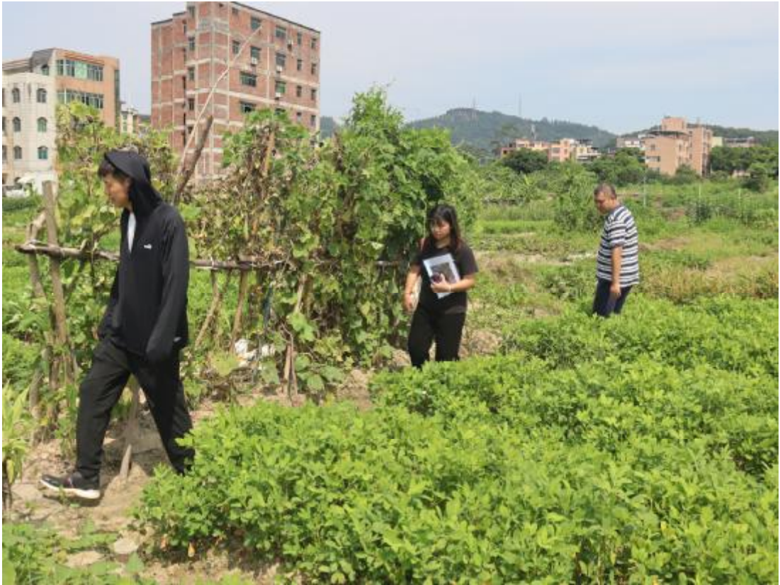
图 7 工作人员现场踏查（南-北）