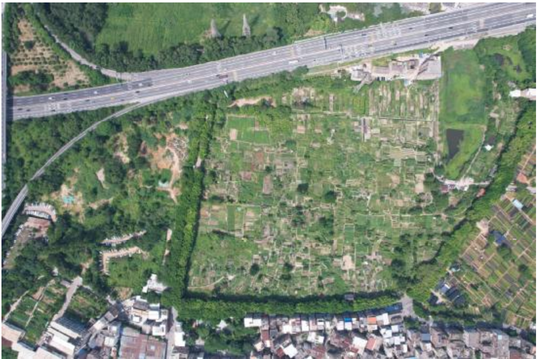
图 8 项目全景航拍（上为西）