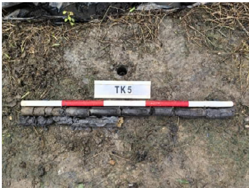
图 27 TK5 土样（标杆长 1 米，土样由左上到右下）

①层：表土层，距地表 0-0.2 米，厚约 0.2 米，为灰褐色黏土，土质疏松，包含植物根茎；该层下即生土，为灰黑色黏土，土质致密、纯净。