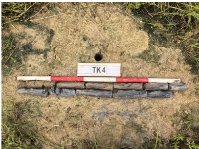
图 26 TK4 土样（标杆长 1 米，土样由左上到右下）

①层：表土层，距地表 0-0.2 米，厚约 0.2 米，为灰褐色黏土，土质疏松，包含植物根茎；该层下即生土，为灰黑色黏土，土质致密、纯净。