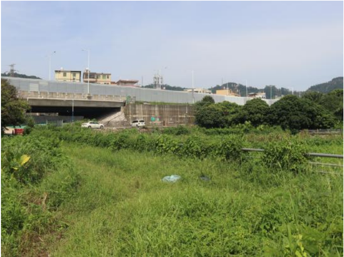
图 18 项目西北部地表现状（东南-西北）