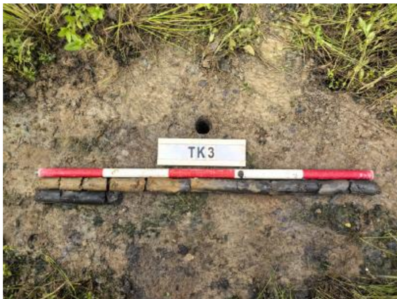
图 25 TK3 土样（标杆长 1 米，土样由左上到右下）

①层：表土层，距地表 0-0.3 米，厚约 0.3 米，为黄褐色黏土，土质疏松，包含植物根茎；该层下即生土，为黄褐色及灰黑色黏土，土质致密、纯净。