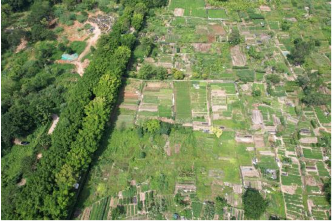
图 11 项目中西部地表现状（东-西）