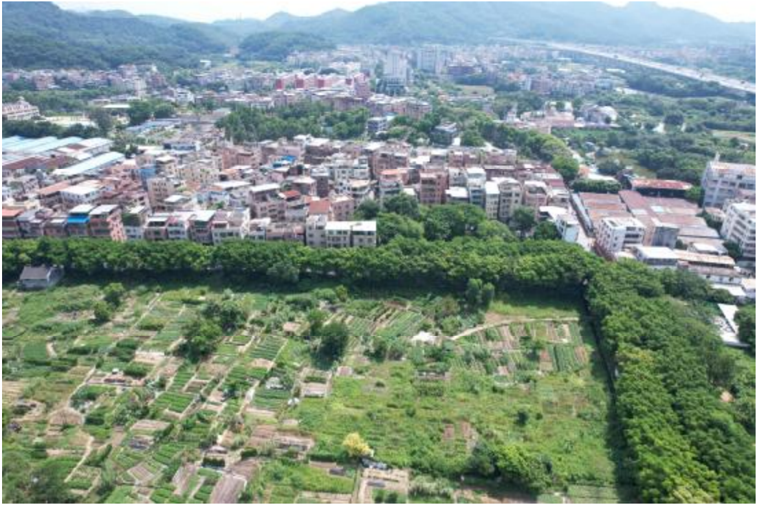
图 13 项目东部地表现状（西-东）