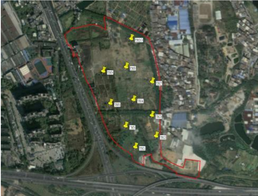
图 21 试探探孔位置示意图（黄色标记点）

为了进一步掌握地块内的地层情况，根据实际条件，我们在地块内部进行了探孔试探，提取 10 个标准型探孔，编号为 TK1-TK10，其具体情况如下：