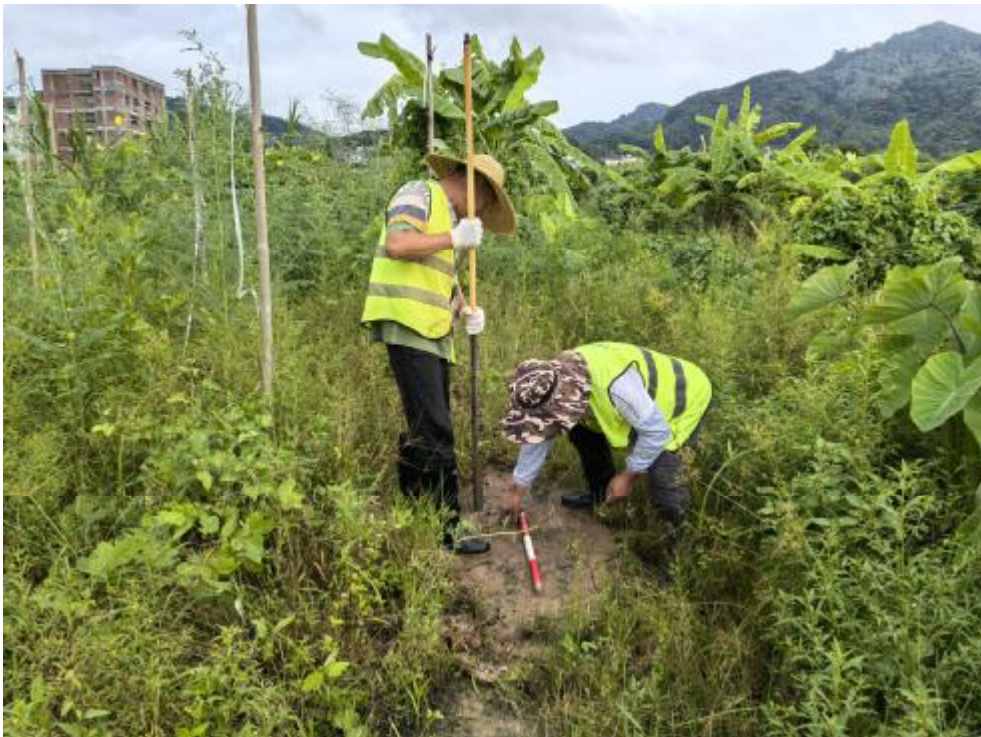
图 22 现场试探（西南-东北）