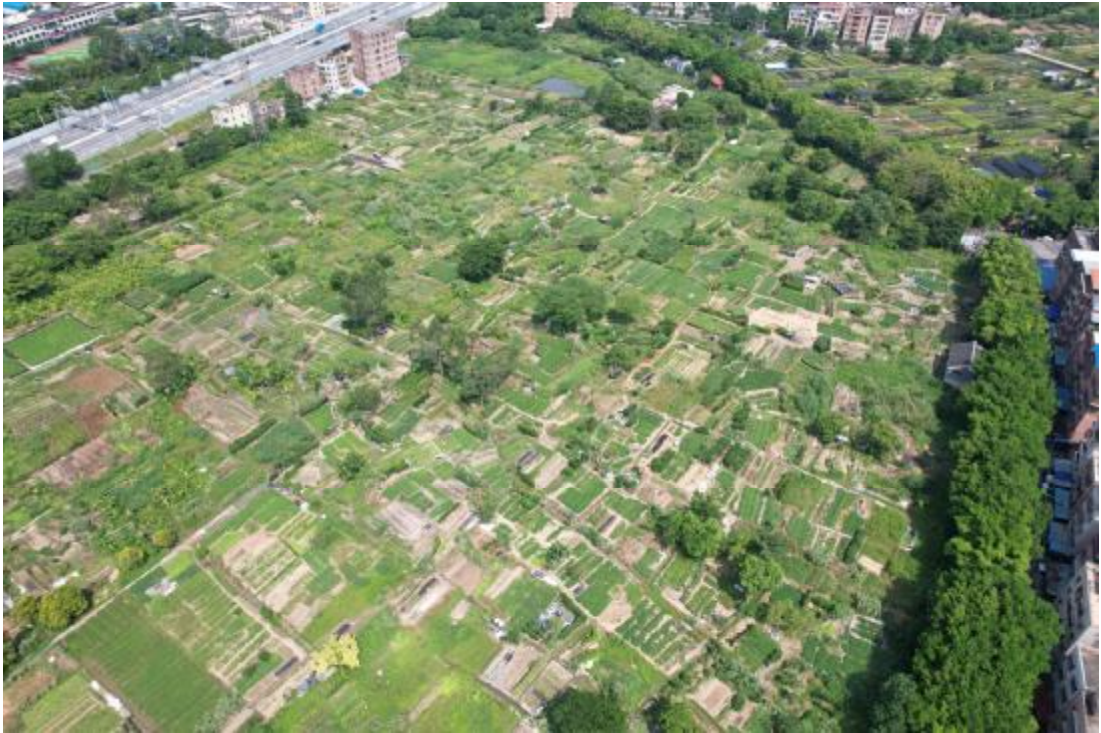
图 12 项目西北部地表现状（东南-西北）