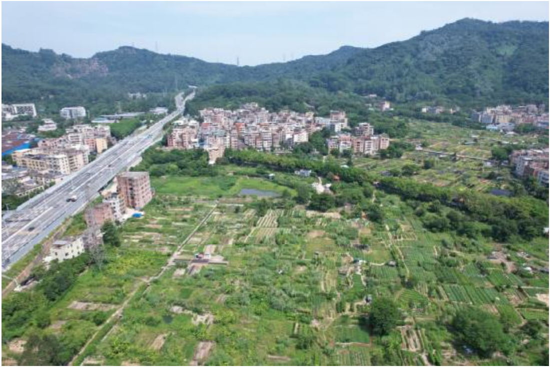
图 9 项目北部地表现状（东北-西南）