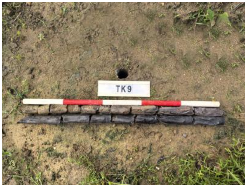
图 31 TK9 土样（标杆长 1 米，土样由左上到右下）

①层：表土层，距地表 0-0.5 米，厚约 0.5 米，为灰褐色黏土，土质疏松，包含植物根茎；该层下即生土，为灰黑色黏土，土质致密、纯净。