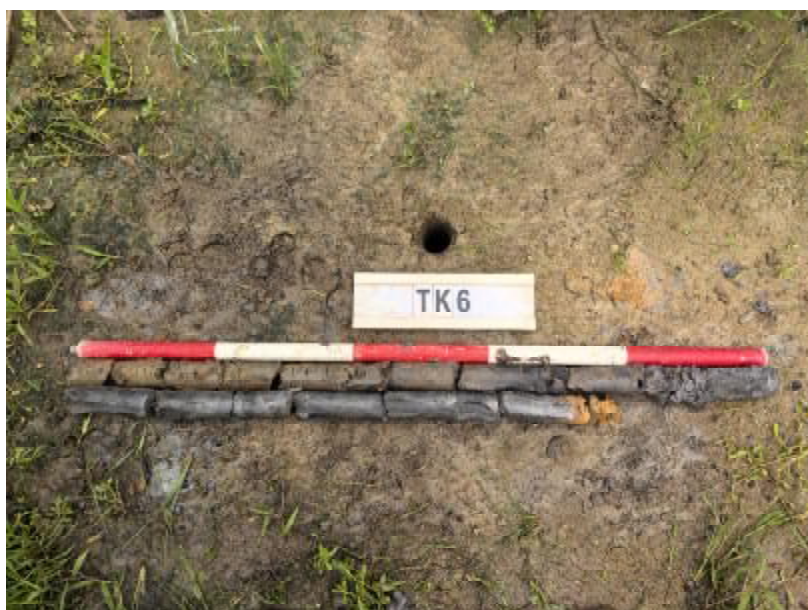
图 28 TK6 土样（标杆长 1 米，土样由左上到右下）

①层：表土层，距地表 0-0.4 米，厚约 0.4 米，为灰褐色黏土，土质疏松，包含植物根茎；该层下即生土，为灰黑色及黄褐色黏土，土质致密、纯净。