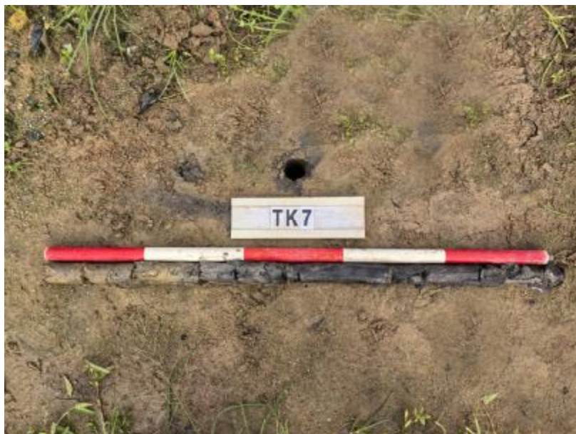
图 29 TK7 土样（标杆长 1 米，土样由左到右）

①层：表土层，距地表 0-0.3 米，厚约 0.3 米，为灰褐色黏土，土质疏松，包含植物根茎；该层下即生土，为灰黑色黏土，土质致密、纯净。