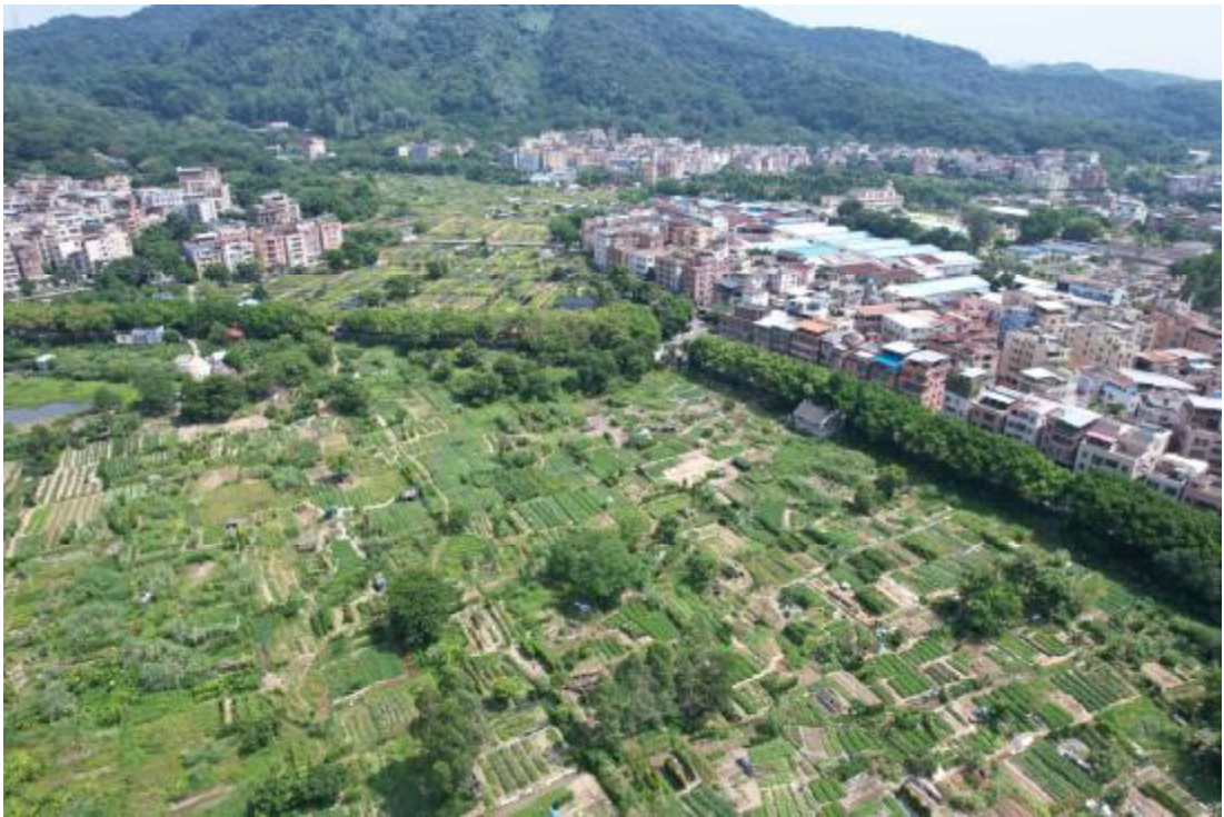
图 14 项目东北部地表现状（西南-东北）