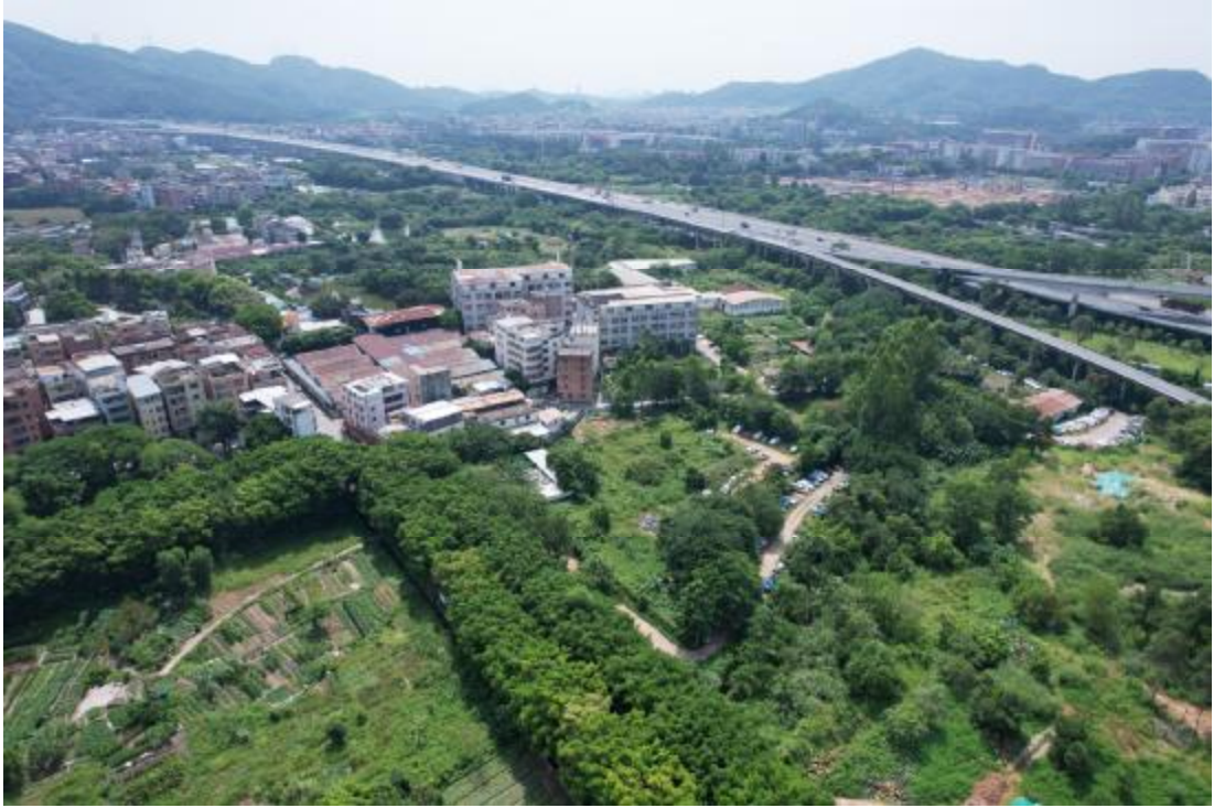
图 15 项目东南部地表现状（西北-东南）