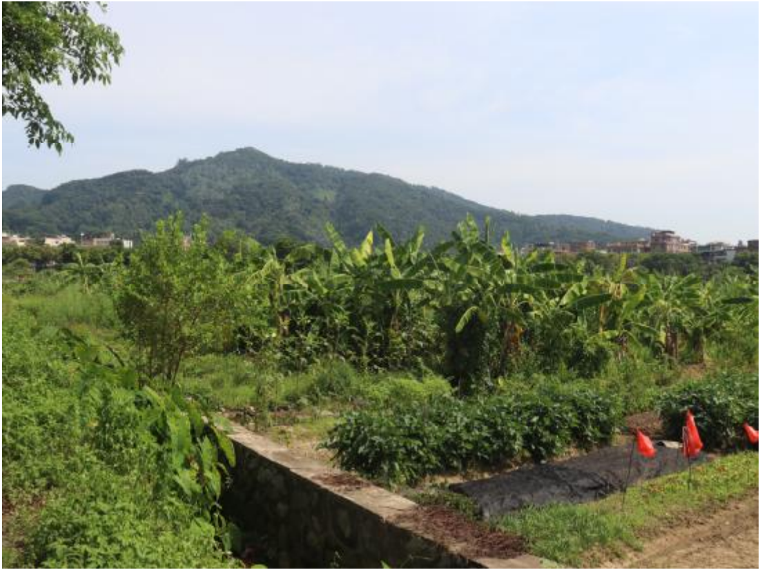
图 19 项目西部地表现状（西南-东北）