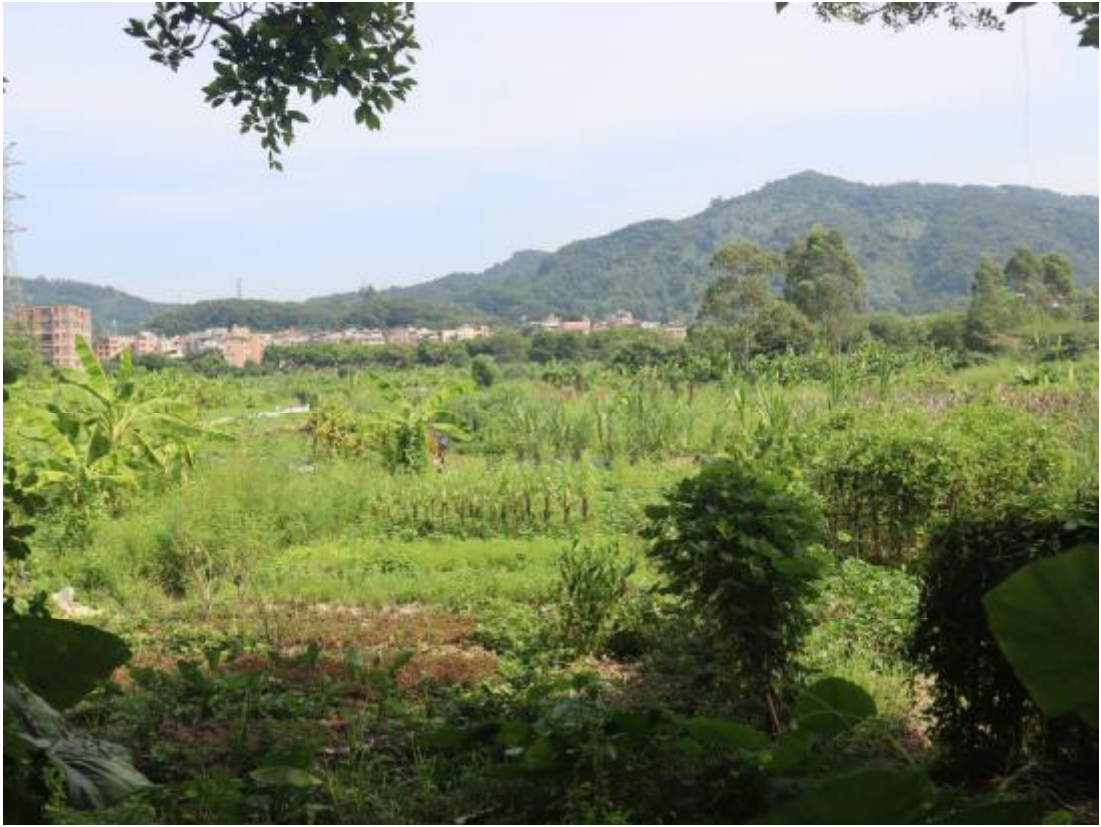
图 17 项目东部地表现状（南-北）