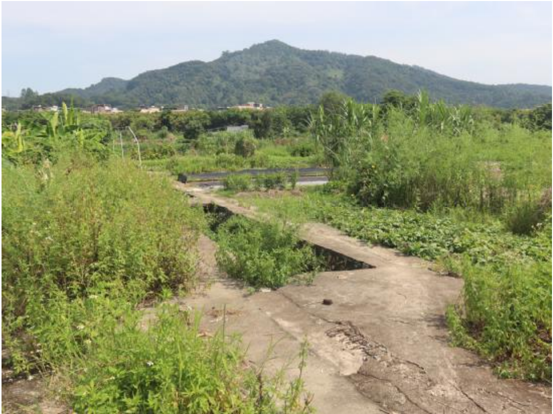
图 16 项目北部地表现状（南-北）