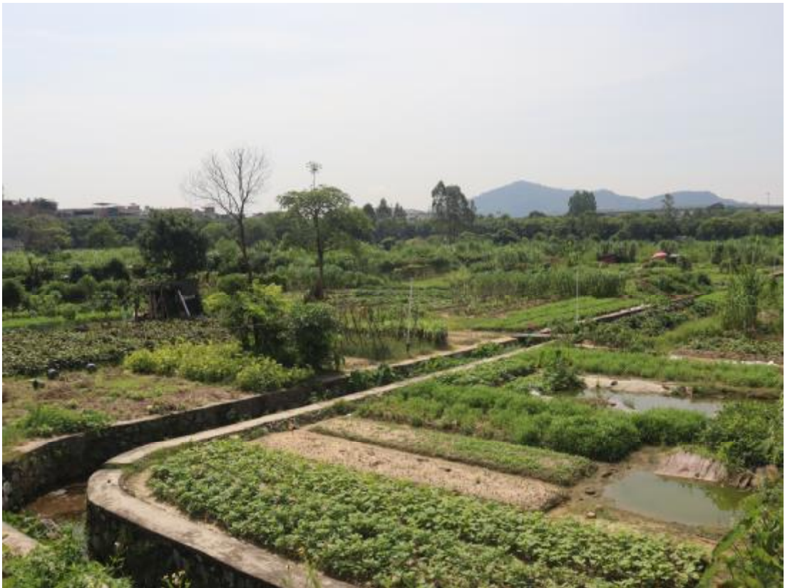
图 20 项目中部地表现状（西-东）