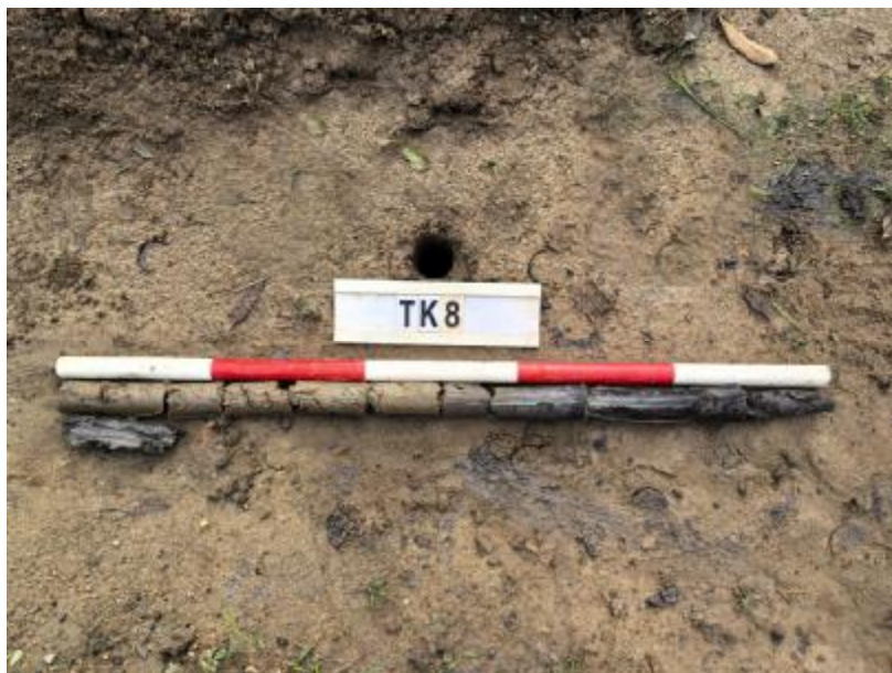
图 30 TK8 土样（标杆长 1 米，土样由左上到右下）

①层：表土层，距地表 0-0.5 米，厚约 0.5 米，为灰褐色黏土，土质疏松，包含植物根茎；该层下即生土，为灰黑色黏土，土质致密、纯净。