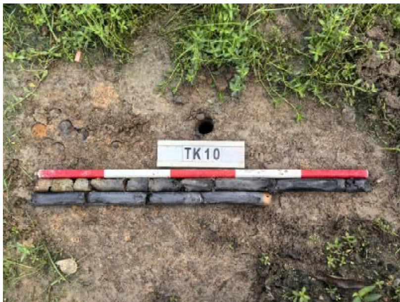
图 32 TK10 土样（标杆长 1 米，土样由左上到右下）

①层：表土层，距地表 0-0.2 米，厚约 0.2 米，为灰褐色黏土，土质松散，包含植物根茎；该层下即生土，为灰黑色黏土，土质致密、纯净。