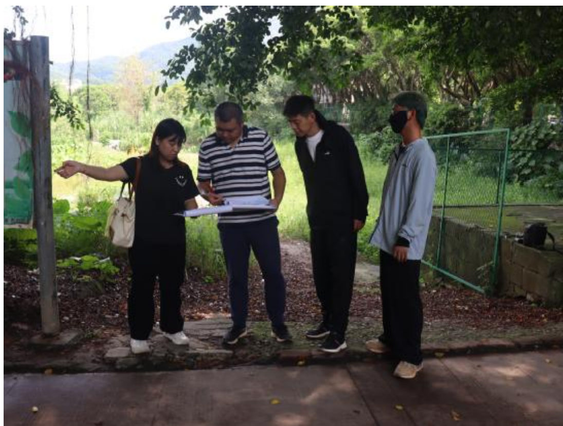
图 6 工作人员对接项目情况（南-北）