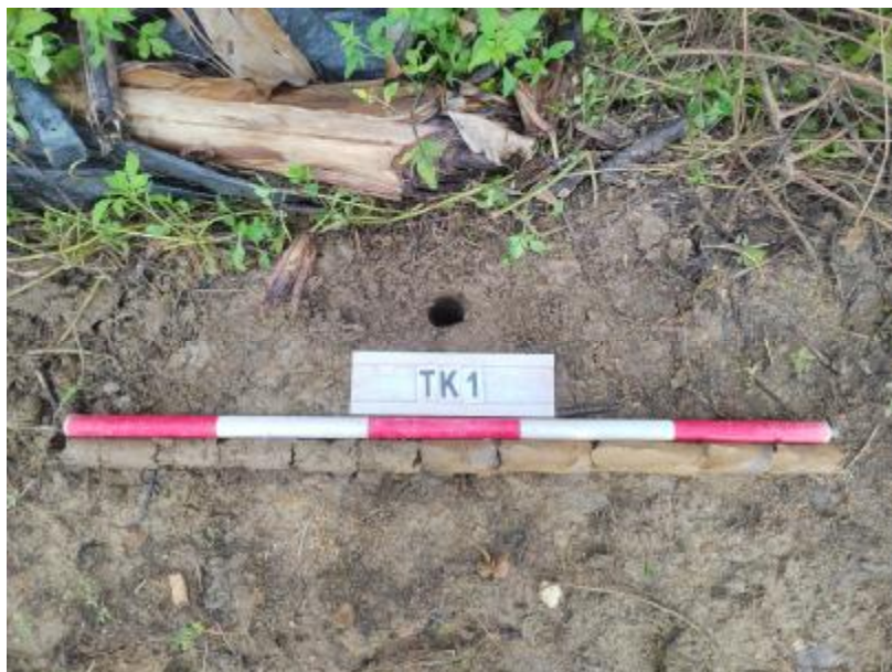
图 23 TK1 土样（标杆长 1 米，土样由左到右）

①层：表土层，距地表 0-0.5 米，厚约 0.5 米，为灰褐色黏土，土质疏松，包含植物根茎；该层下即生土，为黄褐色黏土，土质致密、纯净。