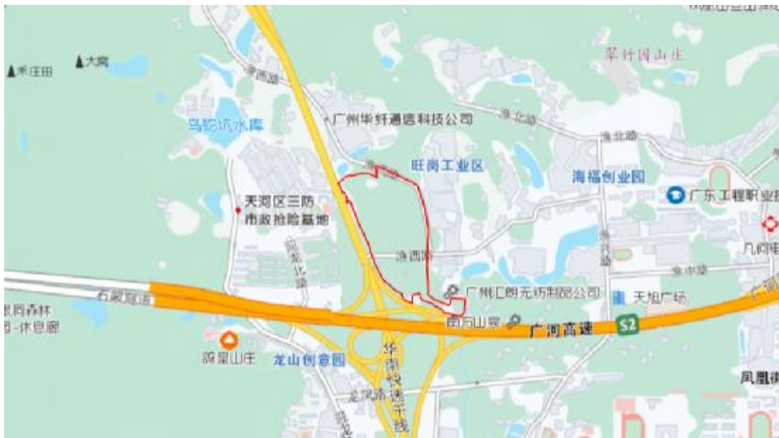
图 3 项目地块周边环境示意图