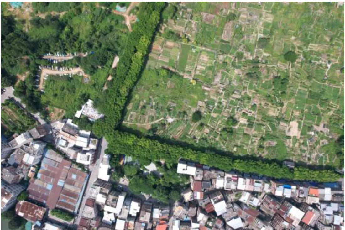
图 10 项目西南地表现状（东-西）