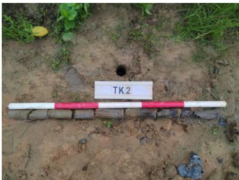
图 24 TK2 土样（标杆长 1 米，土样由左到右）

①层：表土层，距地表 0-0.6 米，厚约 0.6 米，为灰褐色黏土，土质疏松，包含植物根茎；该层下即生土，为灰黑色黏土，土质致密、纯净。