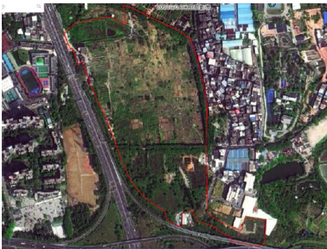
图 4 项目地块卫星红线图