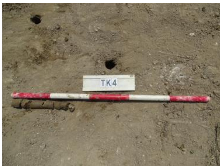
图 33 TK4 土样（一米标杆，土样由左往右）

①层：现代回填土层，距地表深约 0-0.3 米，厚约 0.3 米，为灰褐色沙土，土质疏松，含植物根系等。勘探至 0.3 米，遇石块阻拦，无法提取土样。