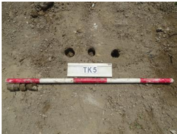
图 34 TK5 土样 (一米标杆,土样由左往右)

①层: 现代回填土层,距地表深约 0-0.2 米,厚约 0.2 米,为灰褐色沙土,土质疏松,含植物根系等。勘探至 0.2 米,遇石块阻拦,无法提取土样。