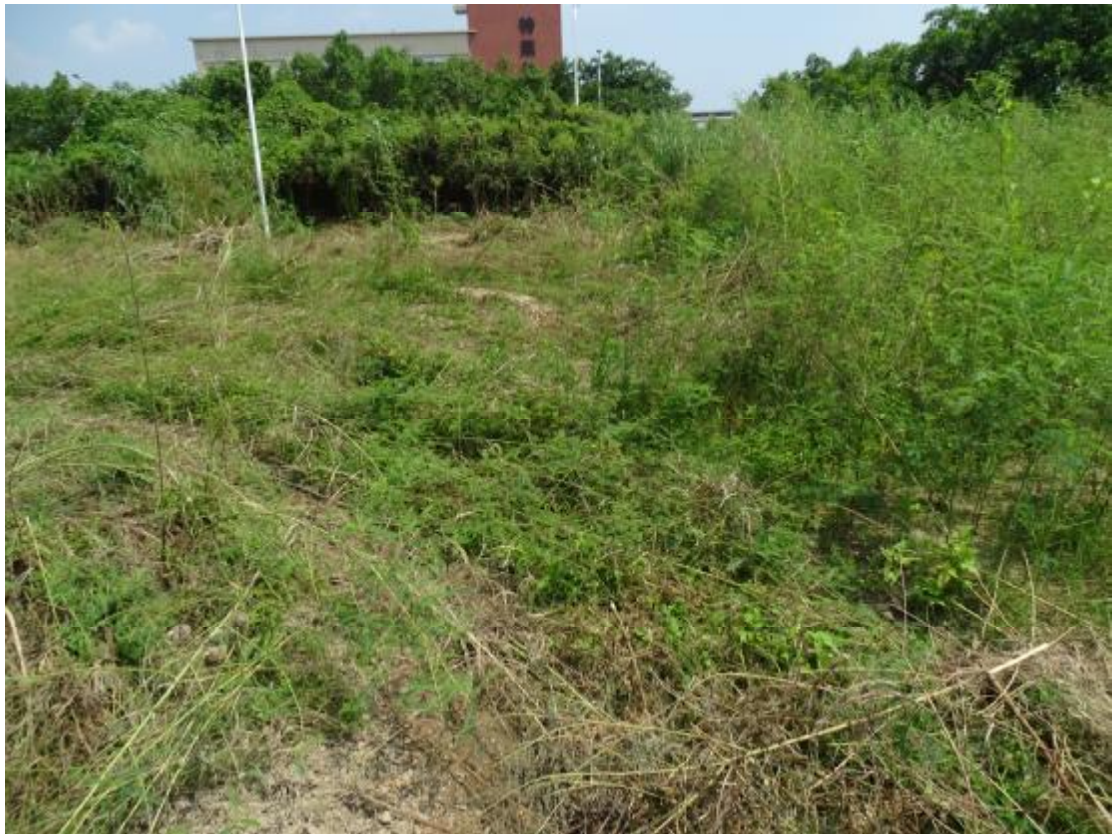
图 21 工程用地地表现状（西-东）