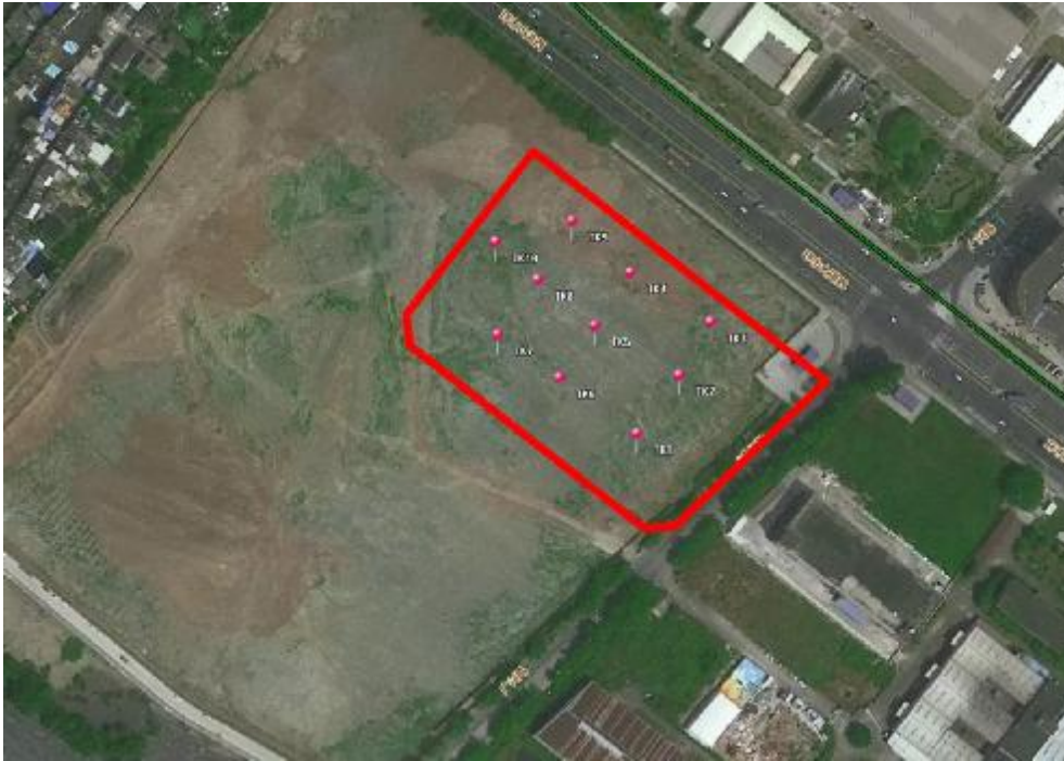
图 24 试探孔位置示意图

根据地形地貌及考古调查的工作需要,为了进一步了解并掌握该地块内地层堆积情况,我们在地块范围内进行试探,共布设 10 个标准型试探孔,编号为 TK1-TK10, 具体介绍如下: