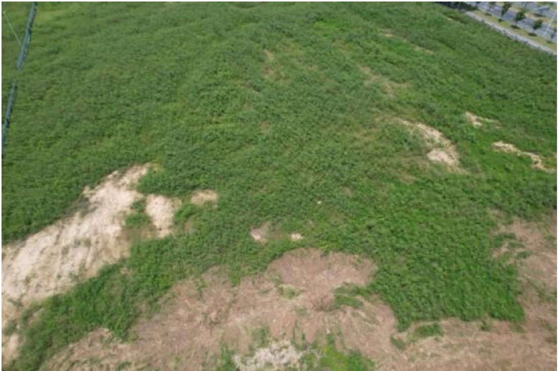
图 13 工程用地航拍（上为西）