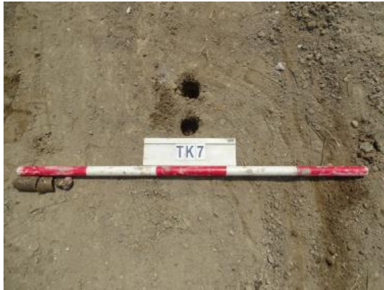
图 36 TK7 土样（一米标杆，土样由左往右）

①层：现代回填土层，距地表深约 0-0.1 米，厚约 0.1 米，为灰褐色沙土，土质疏松，含植物根系等。勘探至 0.1 米，遇石块阻拦，无法提取土样。