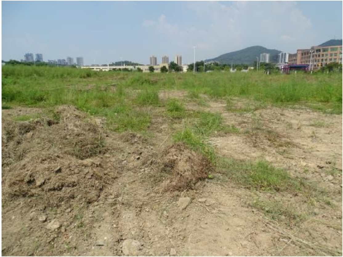
图 16 工程用地地表现状（南-北）