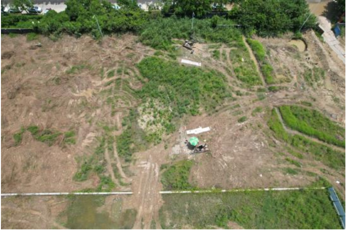
图 10 工程用地航拍（上为东）