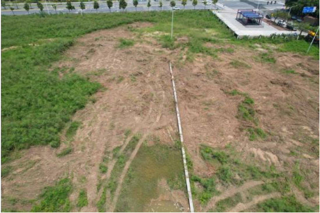
图 12 工程用地航拍（上为北）