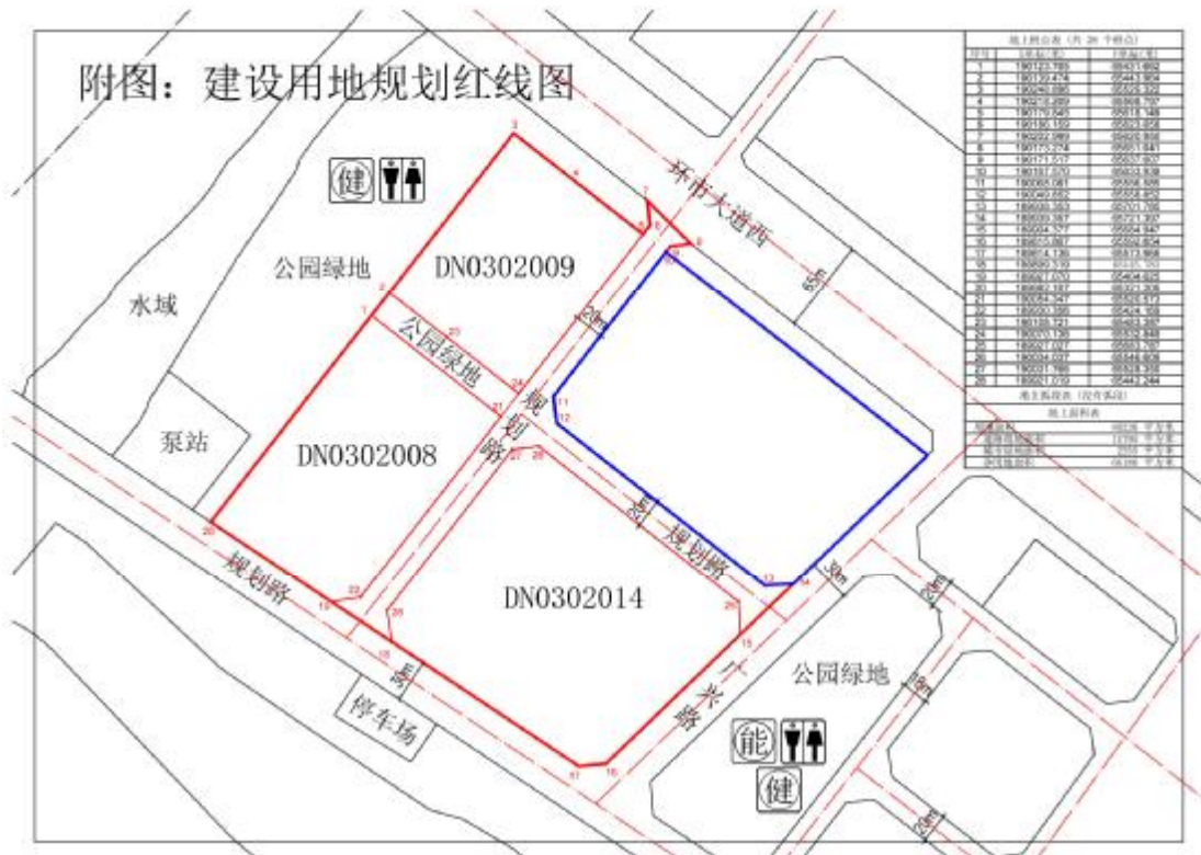
图 5 工程用地规划红线图（蓝线为本次调查范围，红线为已调查范围）