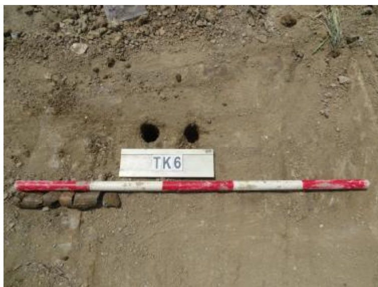
图 35 TK6 土样 (一米标杆,土样由左往右)

①层: 现代回填土层,距地表深约 0-0.25 米,厚约 0.25 米,为灰褐色沙土,土质疏松,含植物根系等。勘探至 0.25 米,遇石块阻拦,无法提取土样。