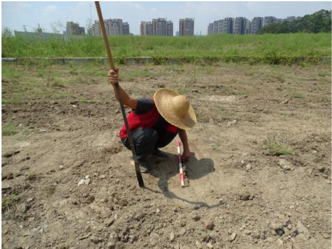
图 28 试探孔土样摆放（东-西）