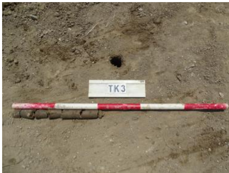
图 32 TK3 土样（一米标杆，土样由左往右）

①层：现代回填土层，距地表深约 0-0.4 米，厚约 0.4 米，为灰褐色沙土，土质疏松，含植物根系等。勘探至 0.4 米，遇石块阻拦，无法提取土样。