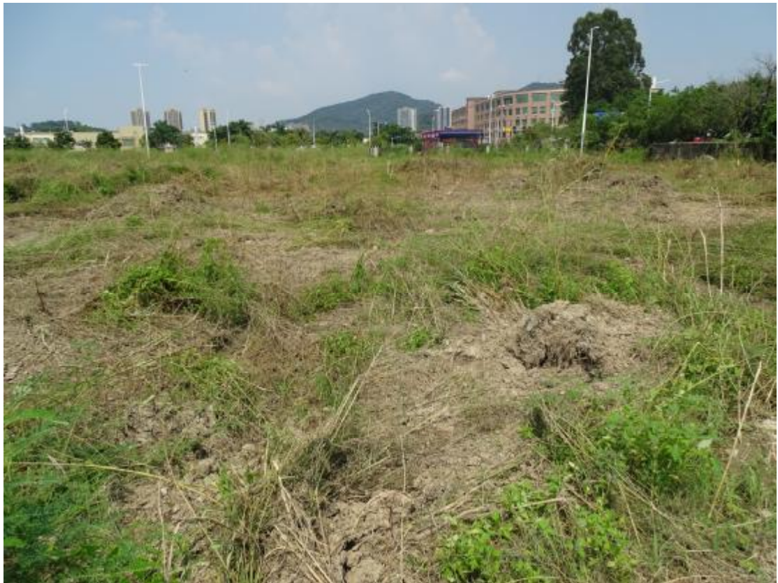
图 19 工程用地地表现状（南-北）