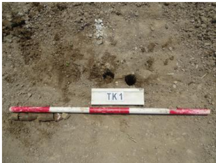
图 30 TK1 土样（一米标杆，土样由左往右）

①层：现代回填土层，距地表深约 0-0.3 米，厚约 0.3 米，为灰褐色沙土，土质疏松，含植物根系等。勘探至 0.3 米，遇石块阻拦，无法提取土样。