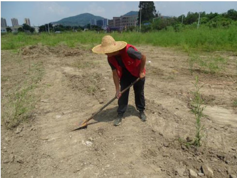
图 25 试探区域清理（南-北）