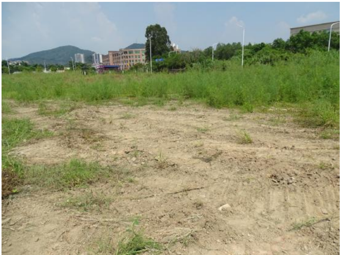
图 15 工程用地地表现状（南-北）