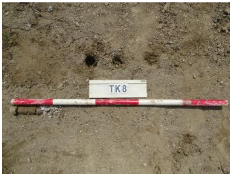
图 37 TK8 土样（一米标杆，土样由左往右）

①层：现代回填土层，距地表深约 0-0.15 米，厚约 0.15 米，为灰褐色沙土，土质疏松，含植物根系等。勘探至 0.15 米，遇石块阻拦，无法提取土样。