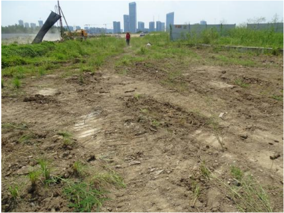
图 18 工程用地地表现状（北-南）