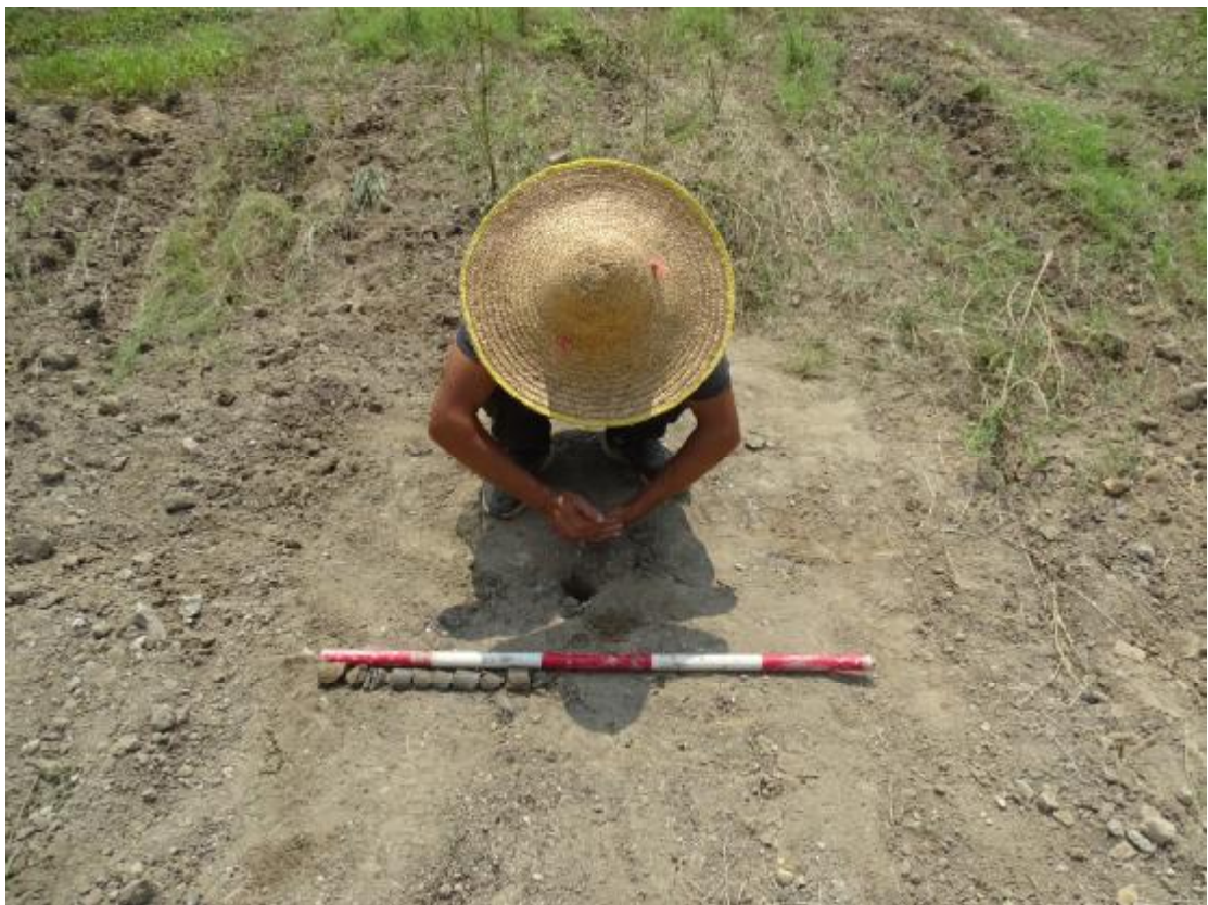
图 29 试探孔坐标测量（北-南）