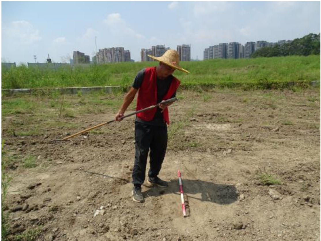
图 27 试探孔土样分析（东-西）