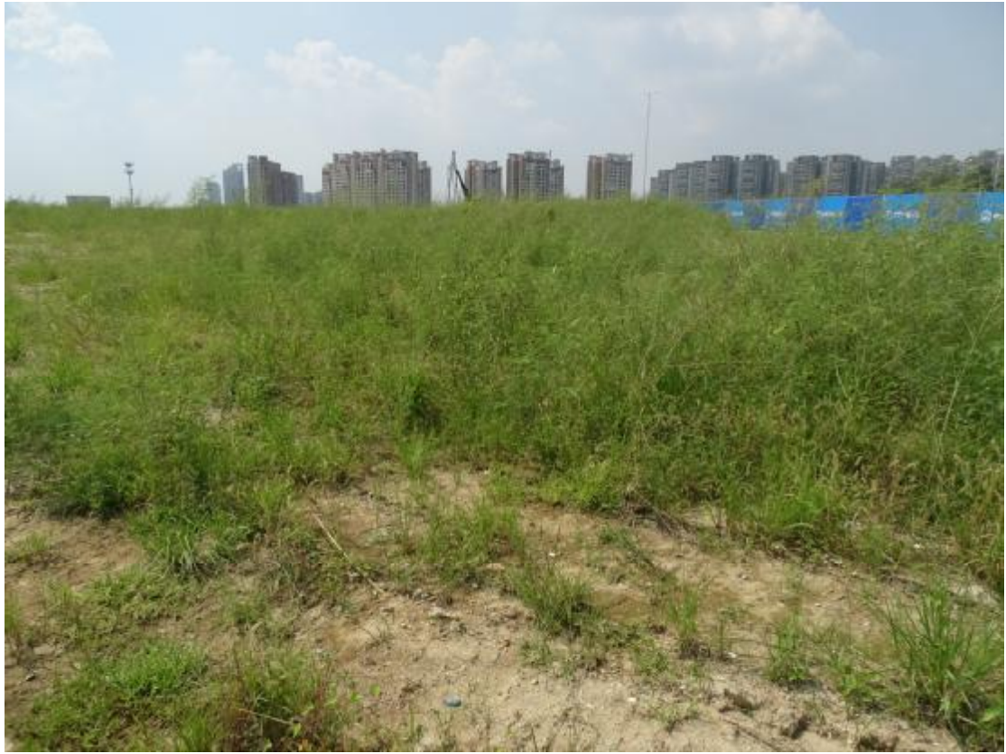
图 22 工程用地地表现状（东-西）