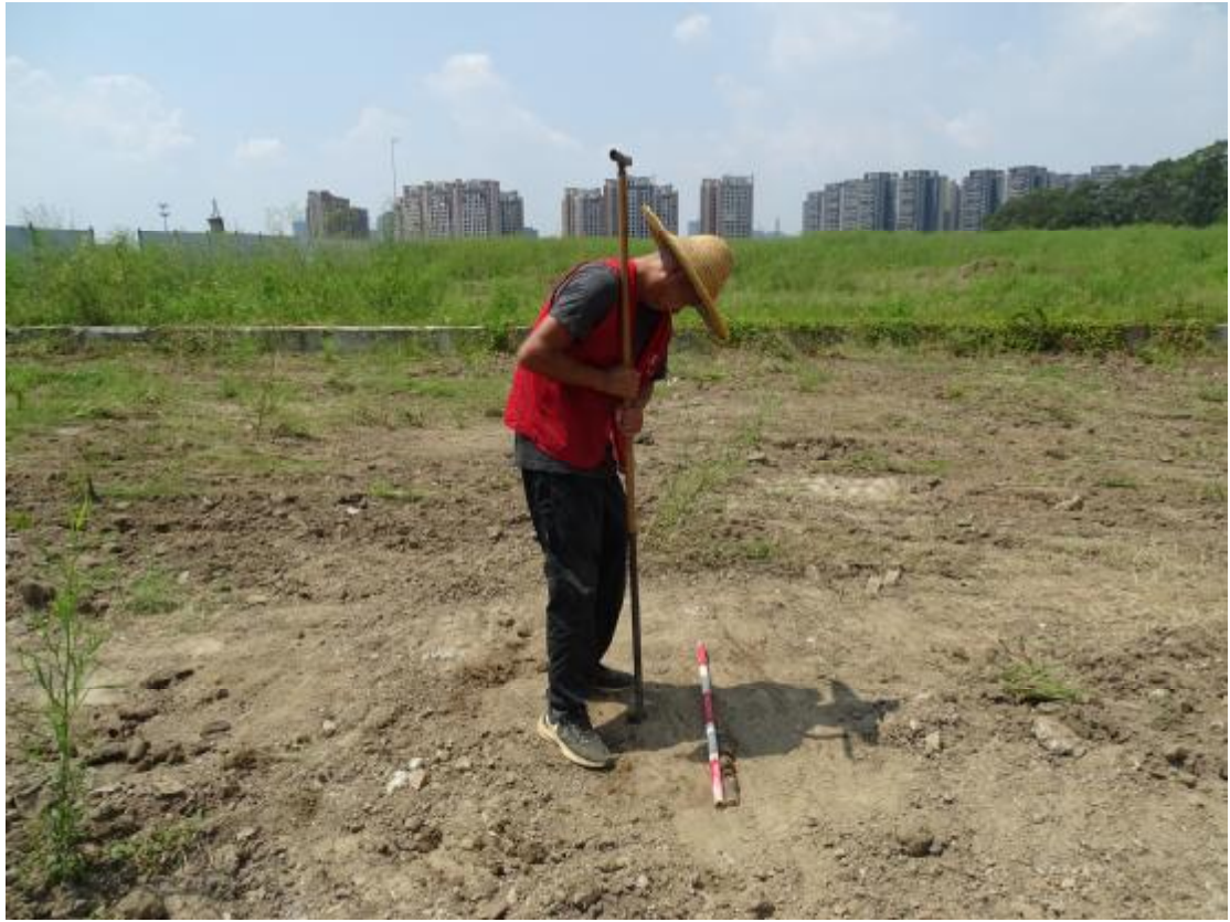
图 26 试探孔土样提取（东-西）