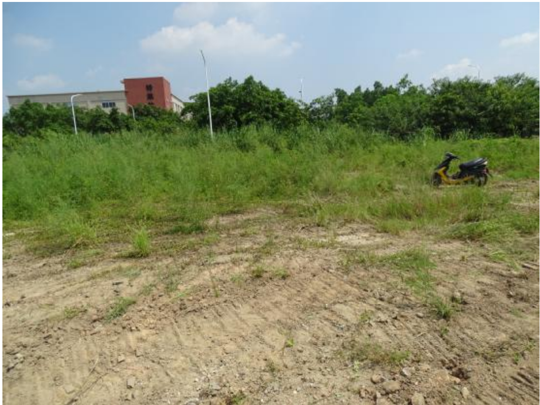
图 14 工程用地地表现状（西-东）