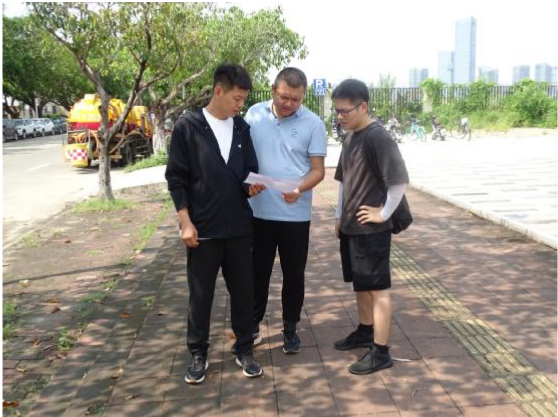
图7 与现场工作人员确定工程用地范围（北-南）