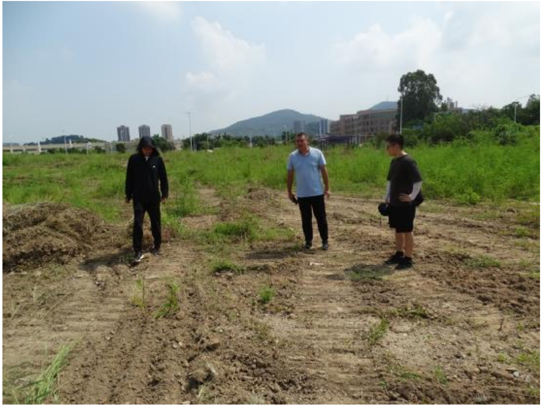
图 8 对工程用地地表进行踏查（南-北）