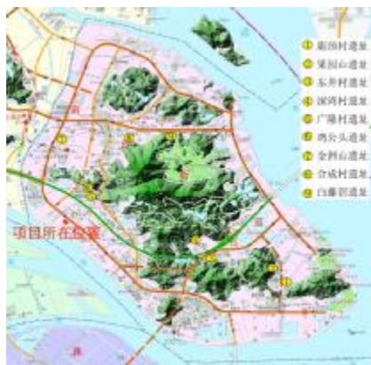
图 6 南沙街道地下文物分布图（红色填充部分为项目所在位置）

2023 年 5 月，我院对大湾区堤防巩固提升工程进行了考古调查工作，未发现古代文化遗存。