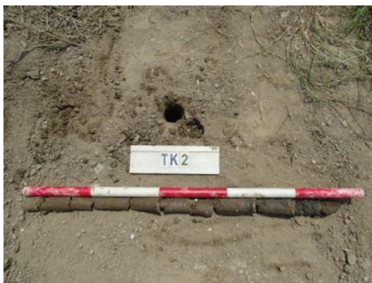
图 31 TK2 土样（一米标杆，土样由左往右）

①层：现代回填土层，距地表深约 0-0.7 米，厚约 0.7 米，为灰褐色沙土，土质疏松，含植物根系等。以下为青灰色淤泥，勘探至 1.0 米，遇石块阻拦，无法提取土样。