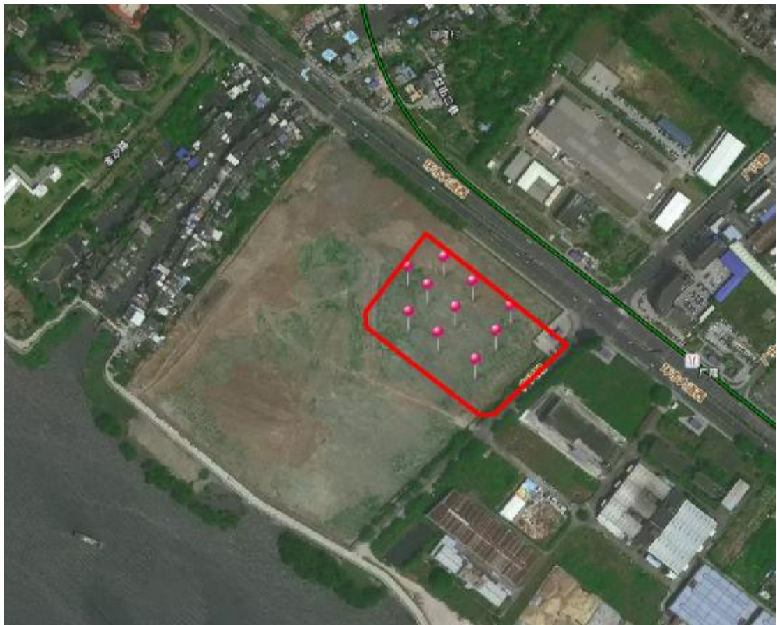
图 3 工程用地卫星红线图 (世纪空间卫星影像图)