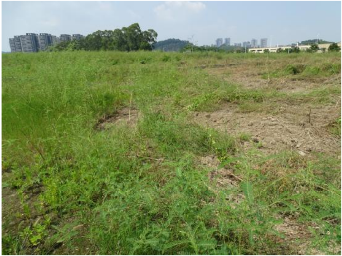
图 20 工程用地地表现状（东-西）