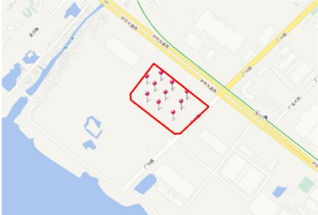
图 4 工程用地周边环境示意图（天地图）