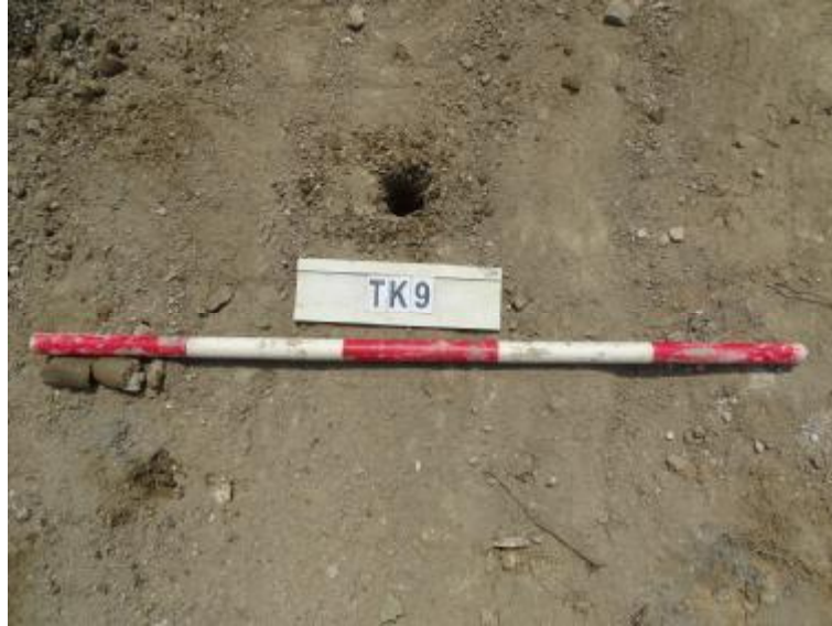
图 38 TK9 土样（一米标杆，土样由左往右）

①层：现代回填土层，距地表深约 0-0.15 米，厚约 0.15 米，为灰褐色沙土，土质疏松，含植物根系等。勘探至 0.15 米，遇石块阻拦，无法提取土样。