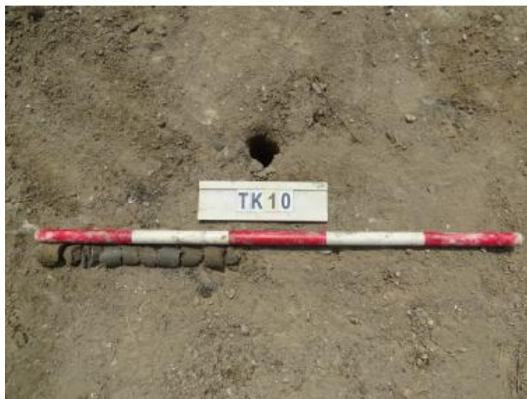
图 39 TK10 土样（一米标杆，土样由左往右）

①层：现代回填土层，距地表深约 0-0.4 米，厚约 0.4 米，为灰褐色沙土，土质疏松，含植物根系等。勘探至 0.4 米，遇石块阻拦，无法提取土样。