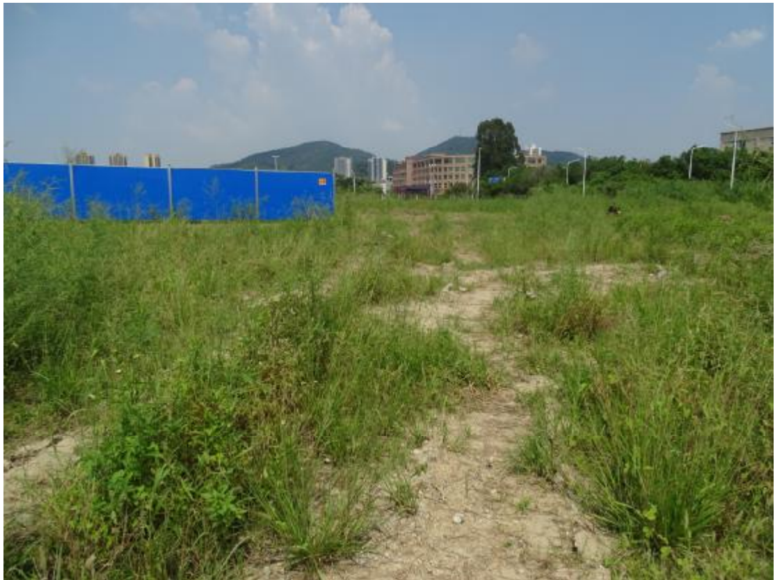
图 23 工程用地地表现状（南-北）