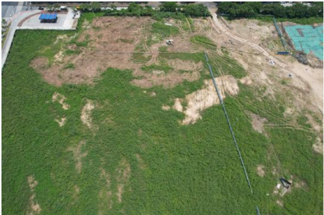
图 9 工程用地航拍（上为东）