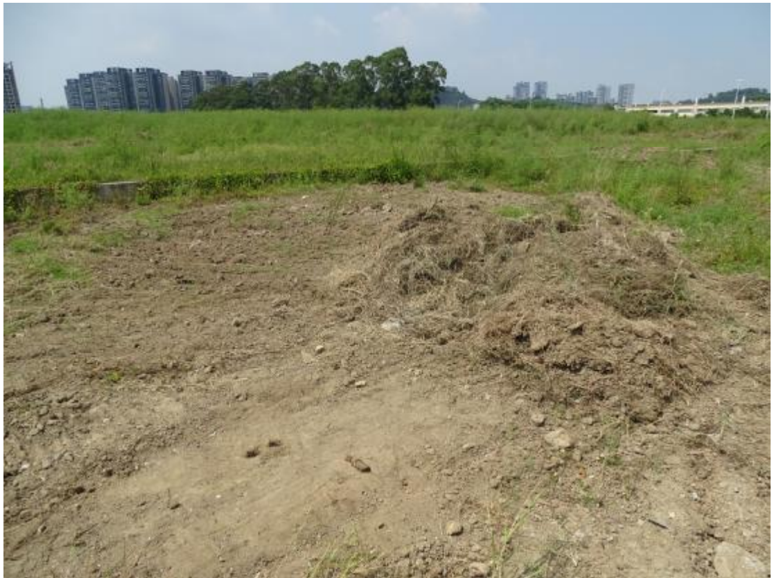
图 17 工程用地地表现状（东-西）