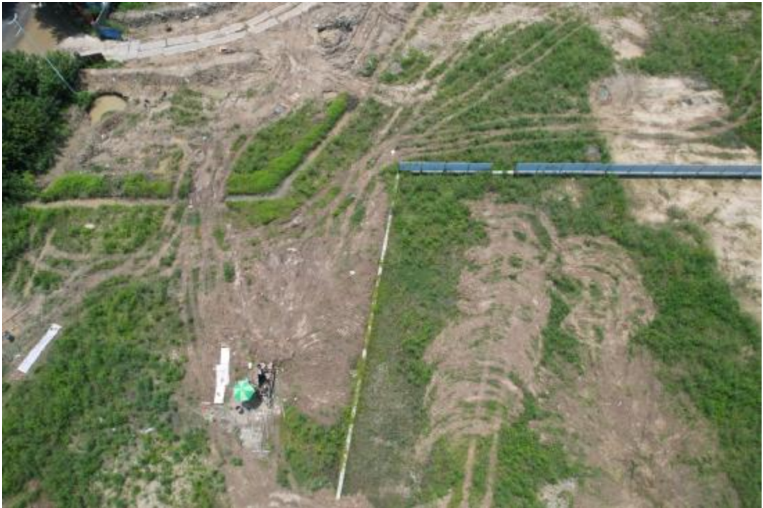
图 11 工程用地航拍（上为南）