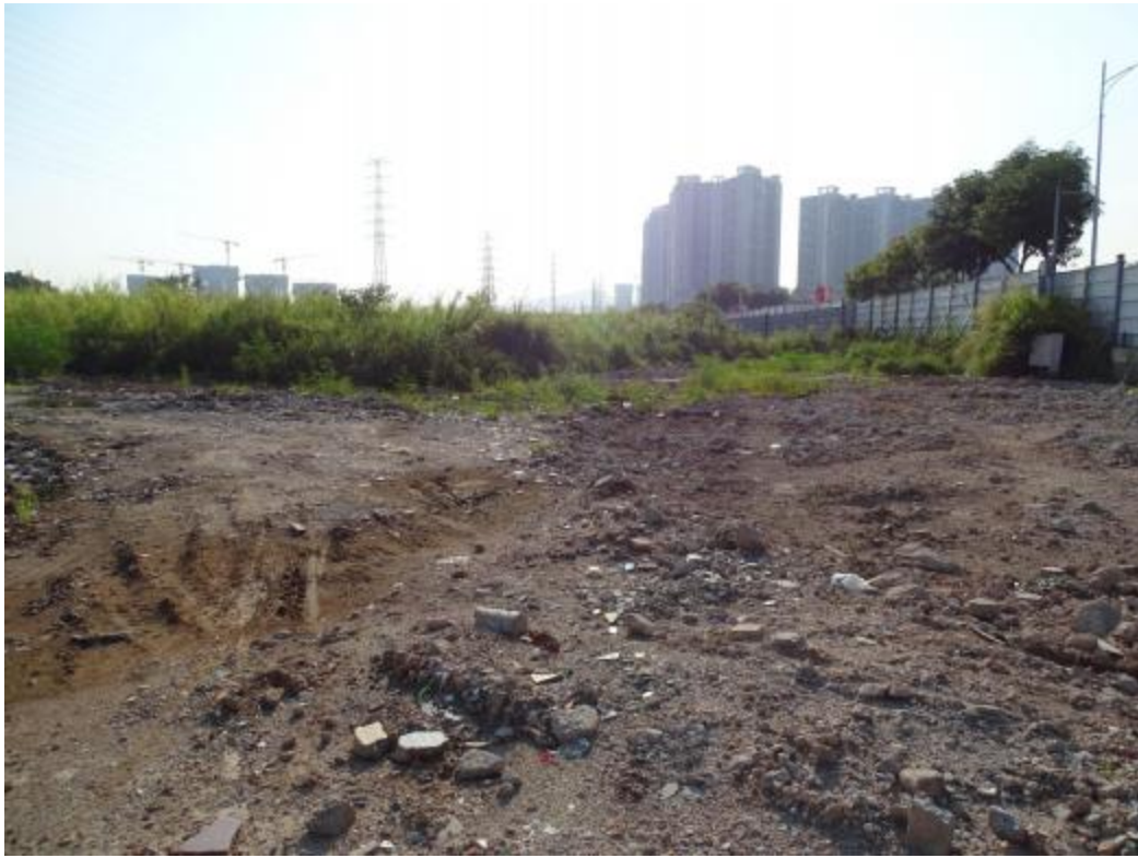
图 31 南部地块地表现状（南-北）