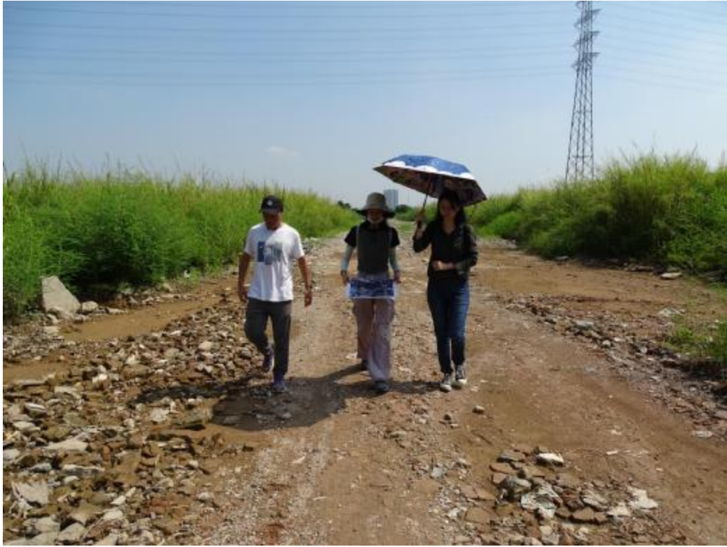
图 15 对南部地块地表进行踏查（南-北）