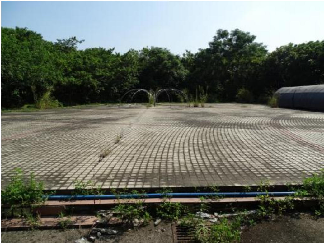
图 18 北部地块地表现状（南-北）