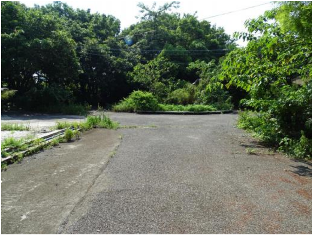
图 17 北部地块地表现状（东-西）