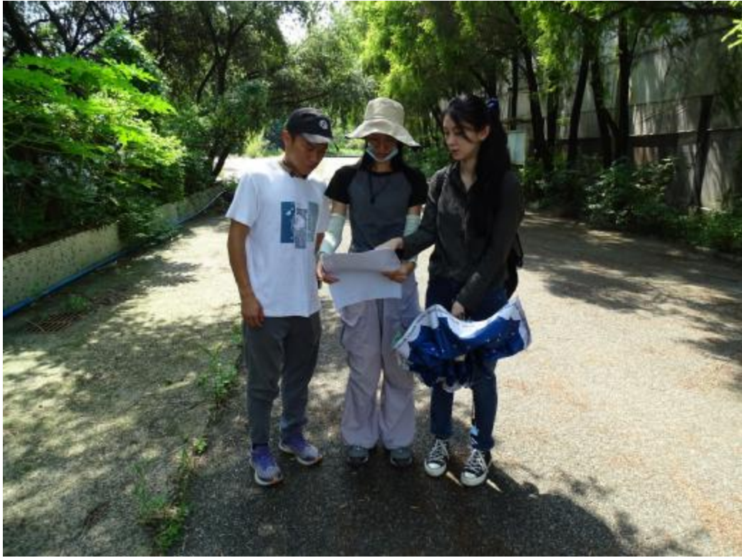
图 11 与工作人员确定北部地块范围（东-西）