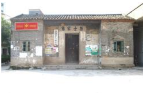
图 10 德士家塾