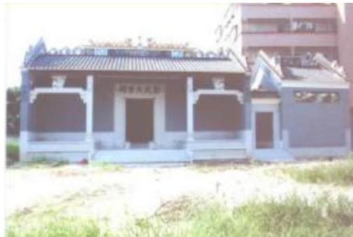
图 8 彭氏大宗祠

刘氏宗祠： 位于联边村彭上中心街，是彭上自然村刘姓族人的太公祠堂。始建于清光绪十年（1885），2004年重修。坐西朝东，建筑占地面积336平方米。2010年12月，公布为白云区第二批登记保护文物保护单位。