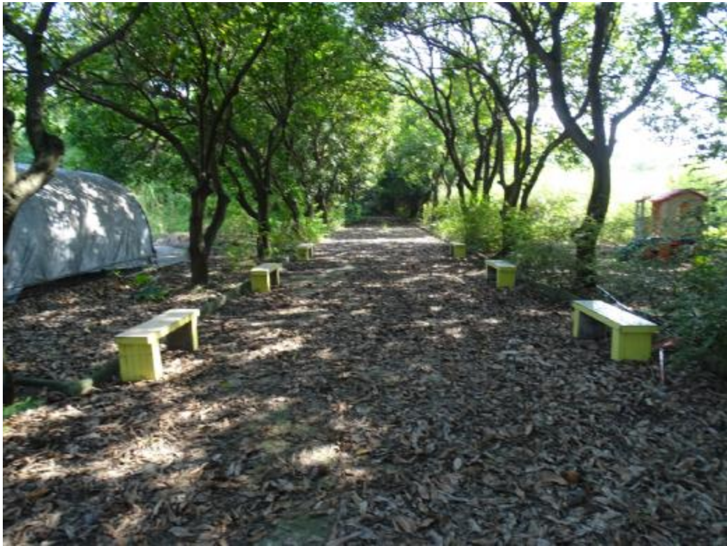
图 25 北部地块地表现状（南-北）