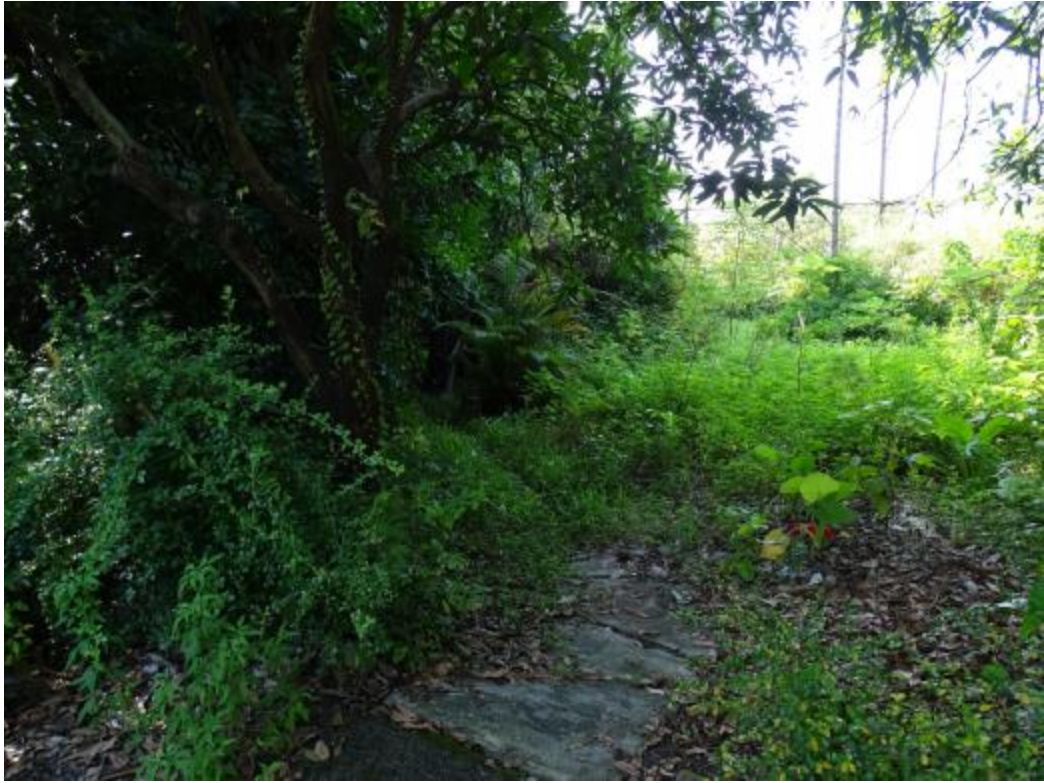
图 23 北部地块地表现状（东-西）