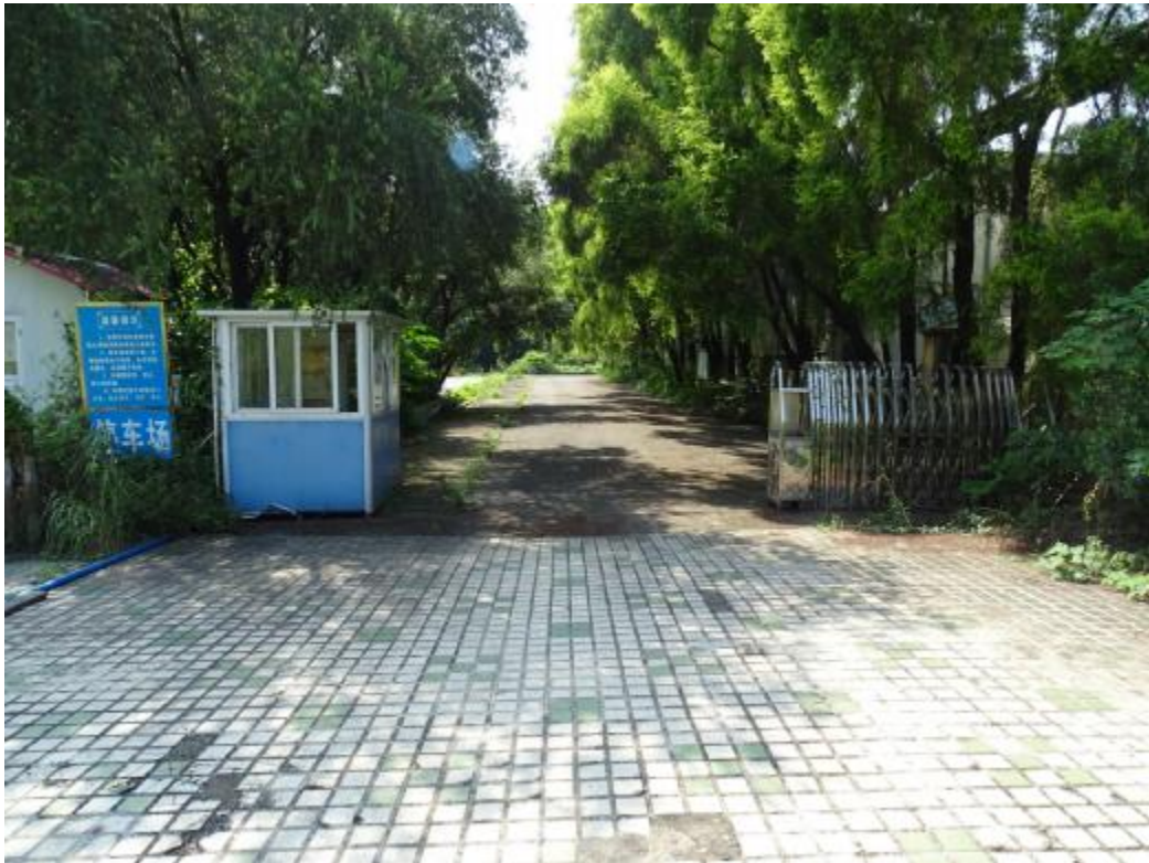
图 16 北部地块地表现状（东-西）