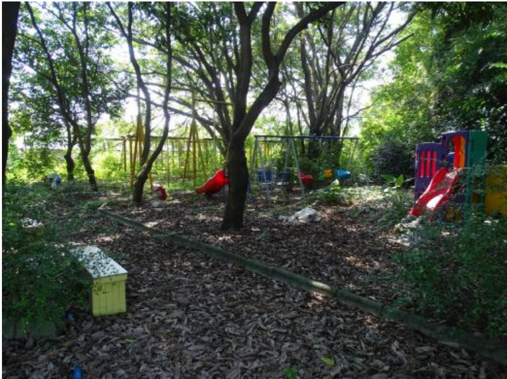
图 24 北部地块地表现状（东-西）