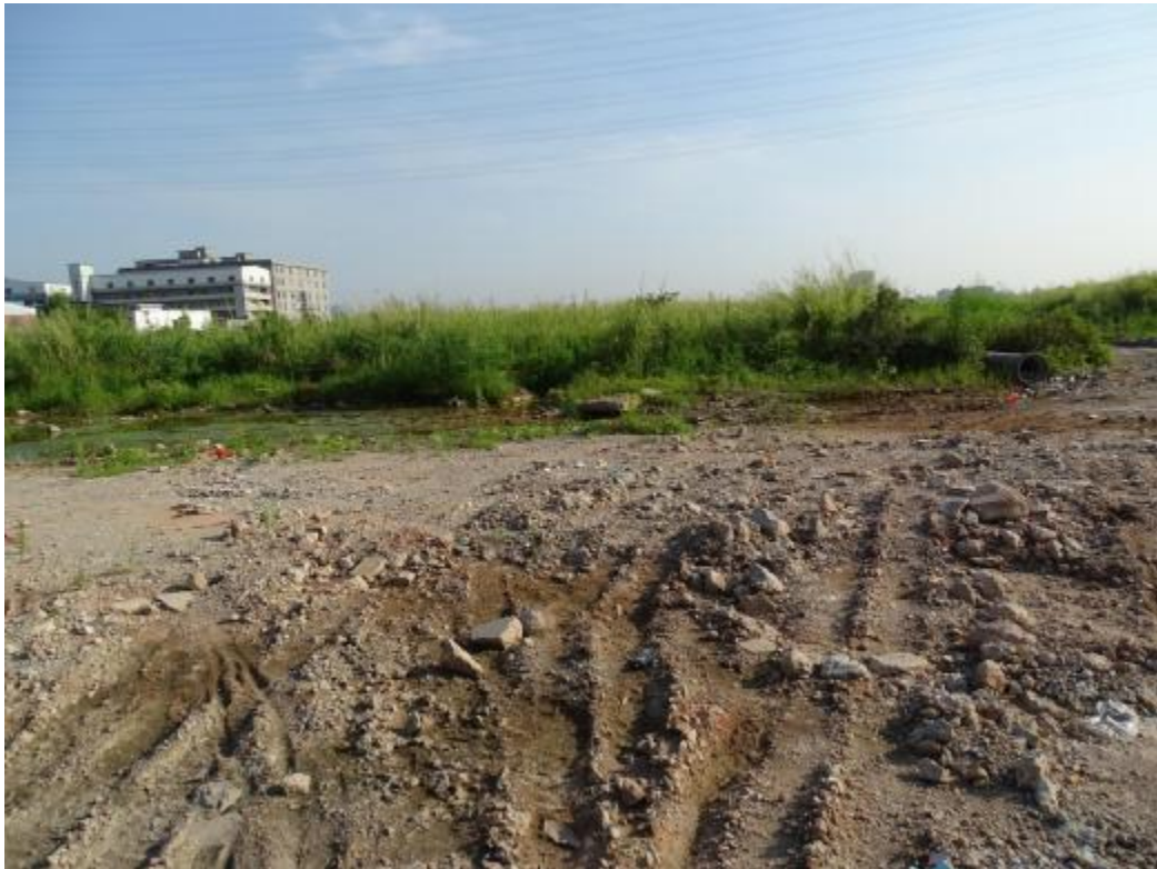
图 30 南部地块地表现状（南-北）