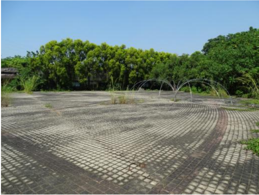
图 29 北部地块地表现状（北-南）