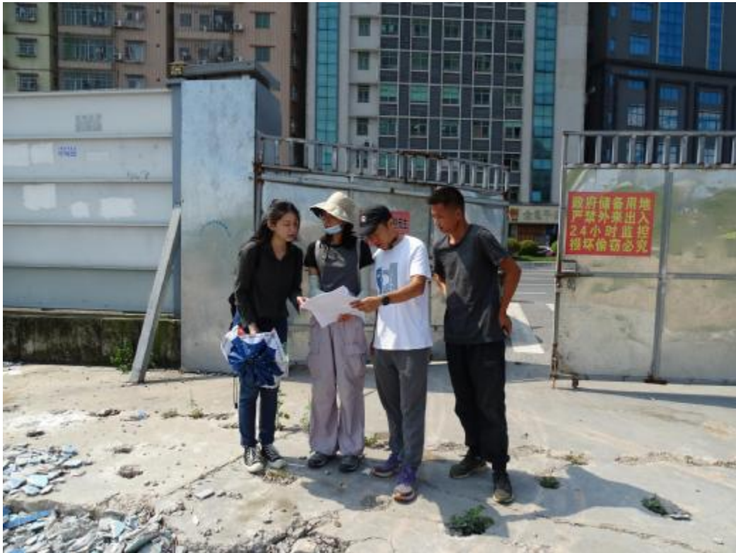
图 12 与工作人员确定南部地块范围（北-南）