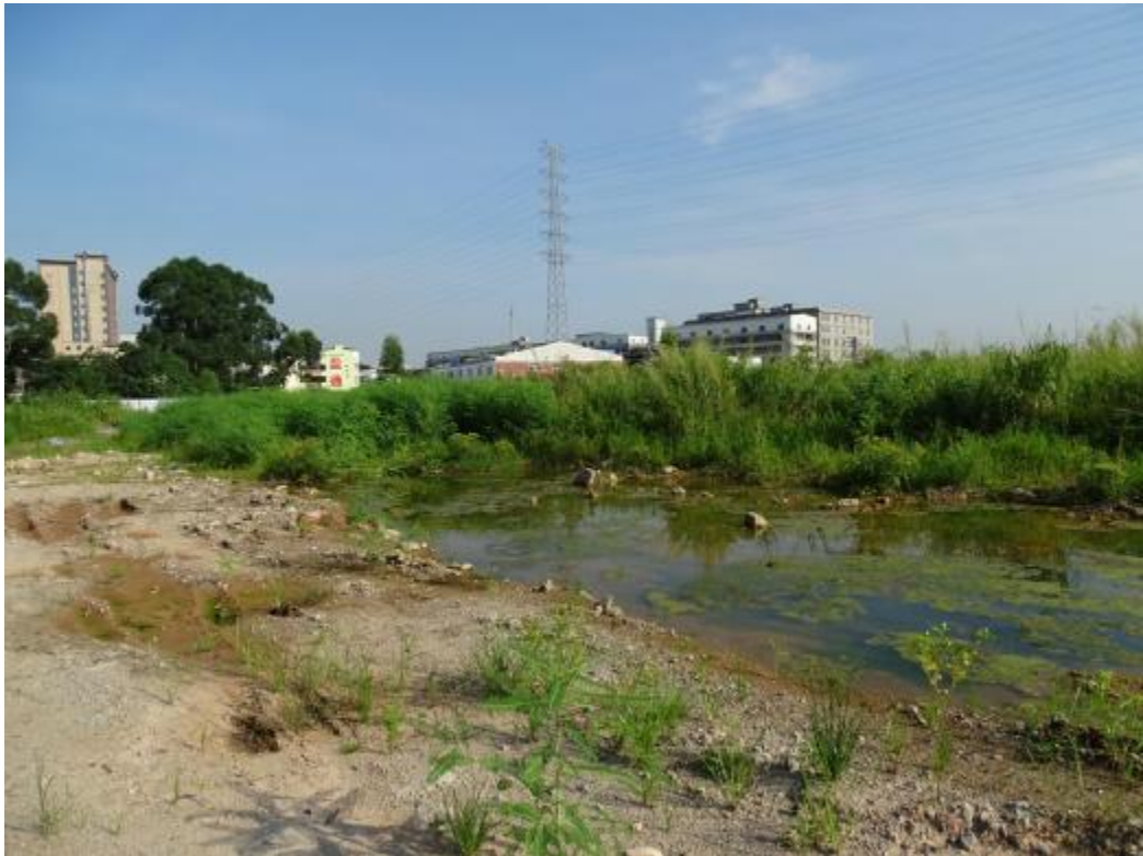
图 42 南部地块地表现状（西-东）