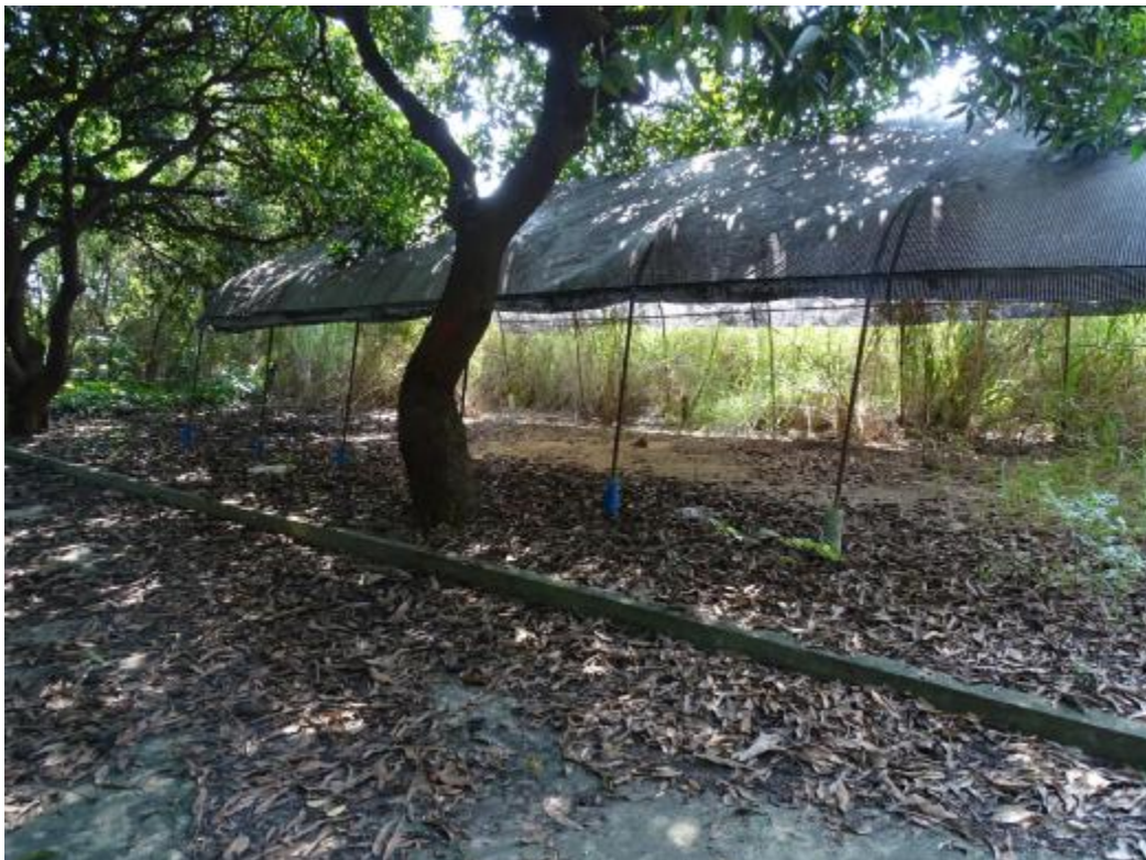
图 26 北部地块地表现状（东-西）