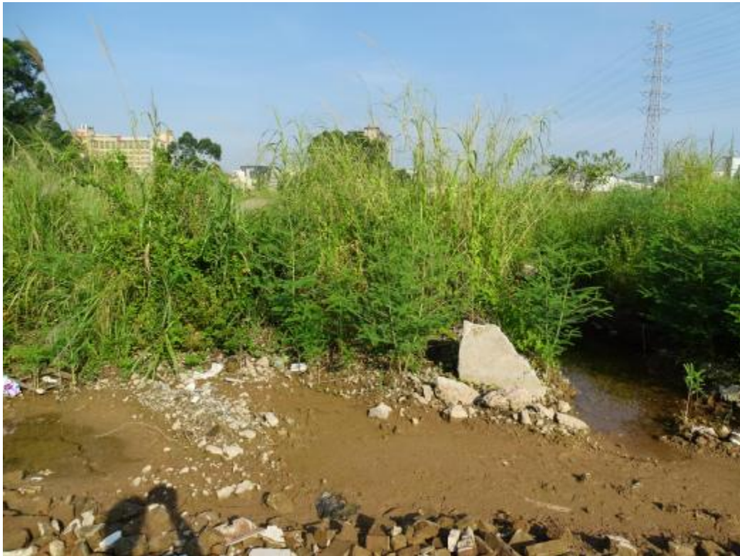
图 36 南部地块地表现状（东-西）