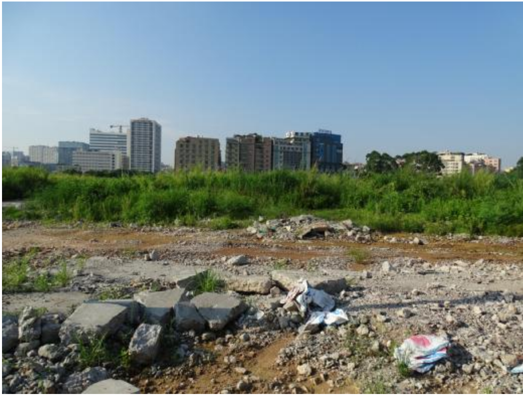
图 39 南部地块地表现状（北-南）