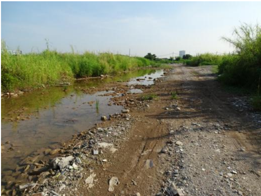
图 38 南部地块地表现状（南-北）