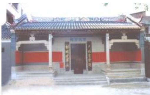
图 9 刘氏宗祠