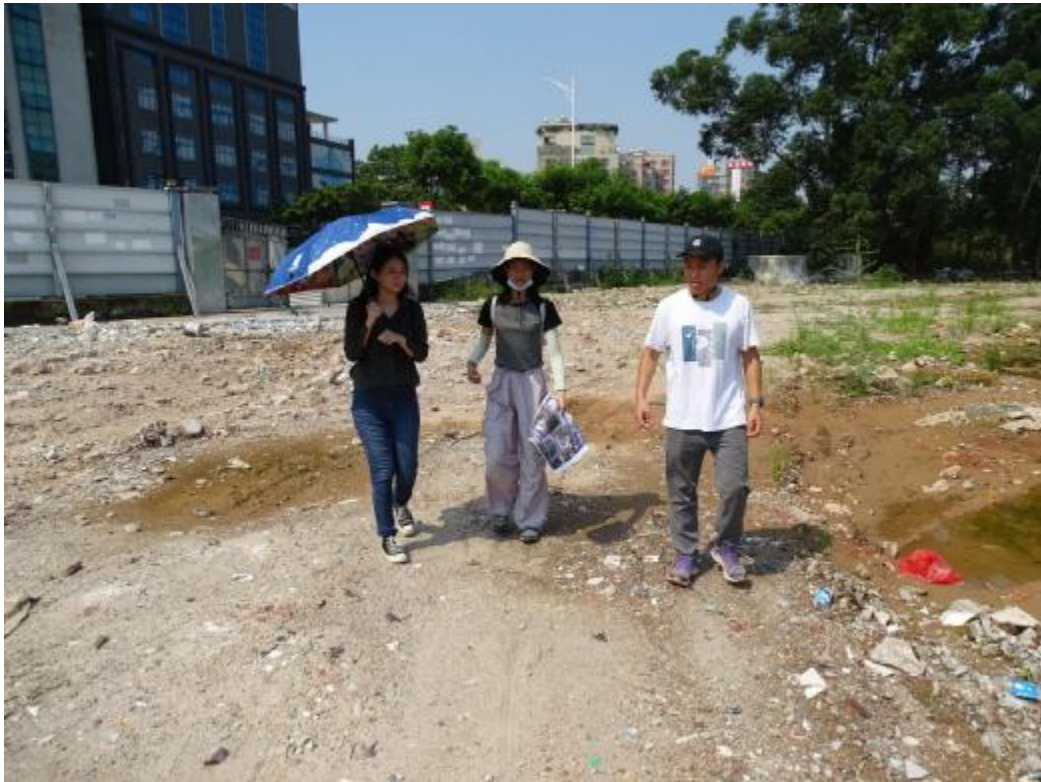
图 14 对南部地块地表进行踏查（北-南）