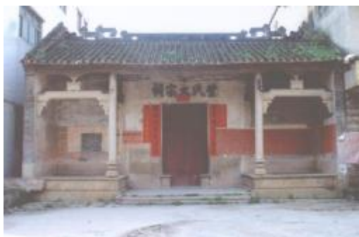
图 7 叶氏大宗祠

于清道光九年（1829），2004年重修。该祠坐北朝南，三路两进，占地面积约717平方米，前面有约400平方米地坪。