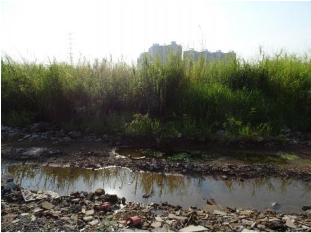
图 37 南部地块地表现状（西-东）