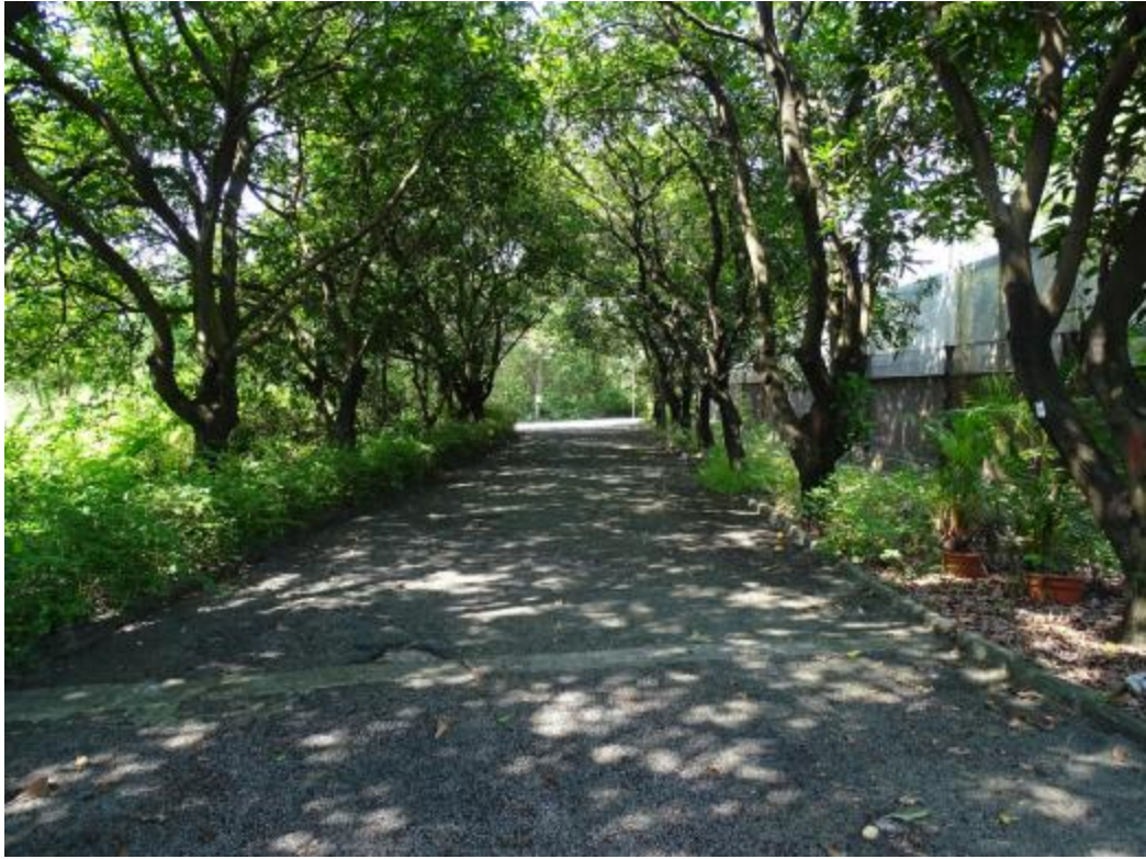
图 21 北部地块地表现状（北-南）