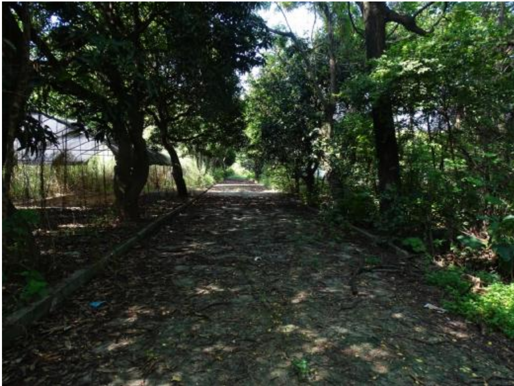
图 28 北部地块地表现状（北-南）