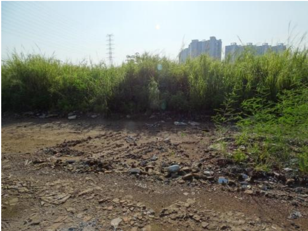
图 34 南部地块地表现状（东-西）