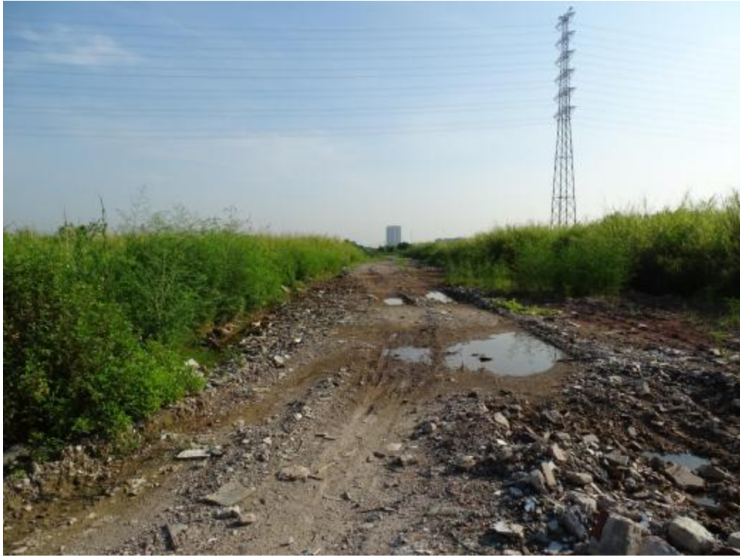
图 33 南部地块地表现状（南-北）