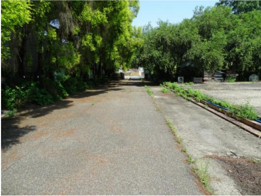
图 19 北部地块地表现状（北-南）