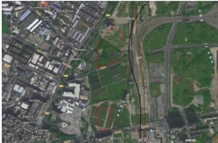
图 3 地块卫星红线图（世纪空间卫星影像图）