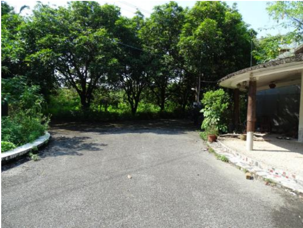
图 20 北部地块地表现状（东-西）