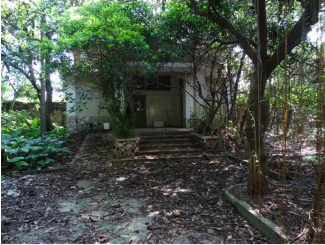
图 27 北部地块地表现状（南-北）