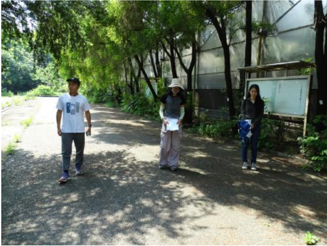
图 13 对北部地块地表进行踏查（东-西）