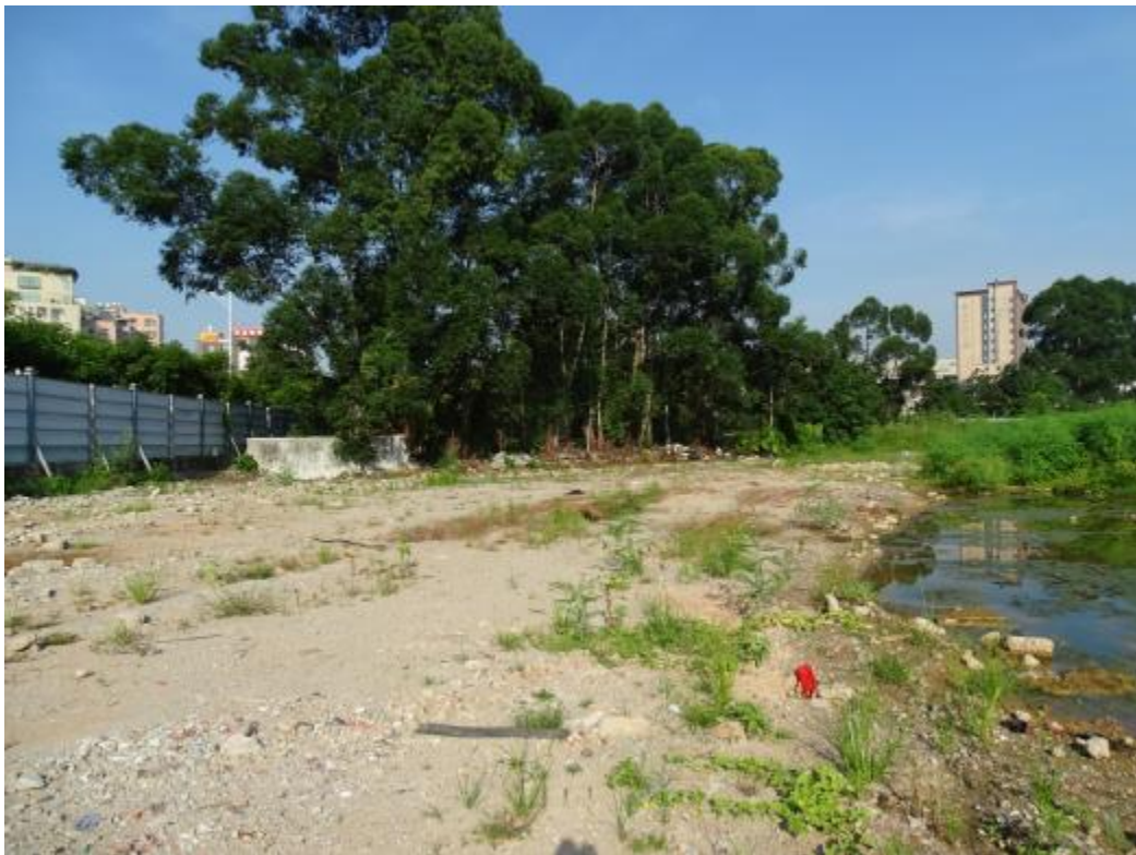
图 32 南部地块地表现状（西-东）