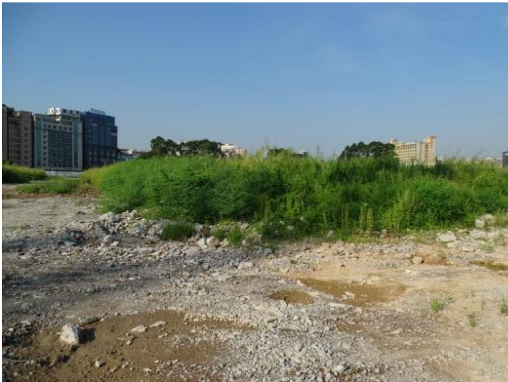
图 40 南部地块地表现状（北-南）