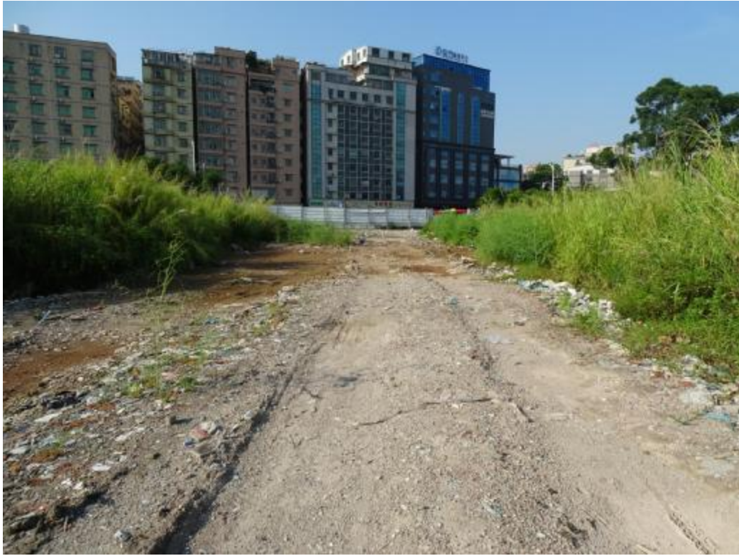
图 35 南部地块地表现状（北-南）