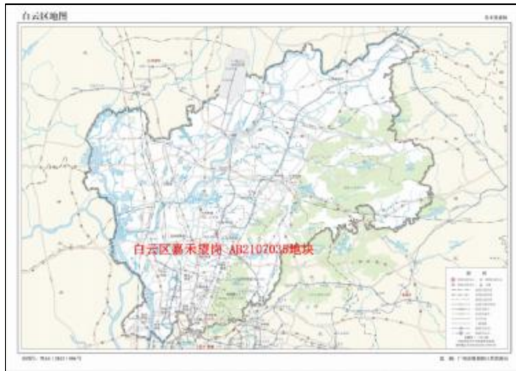
图 2 地块在白云区的位置示意图（广州市规划和自然资源局）