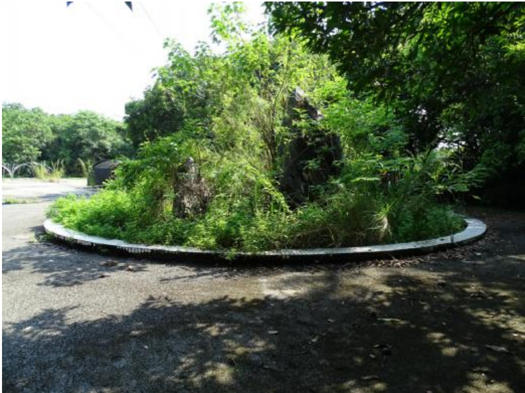
图 22 北部地块地表现状（南-北）