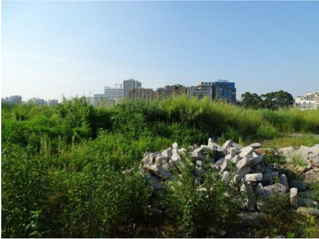
图 41 南部地块地表现状（北-南）