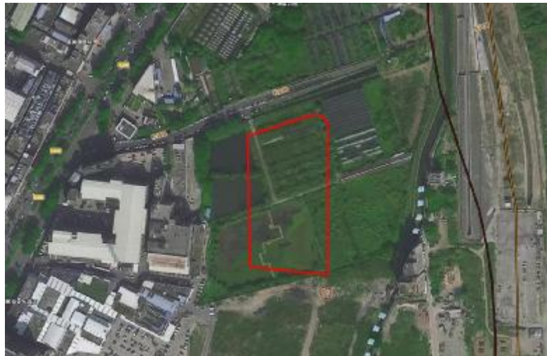
图 3 地块卫星红线图（世纪空间卫星影像图）