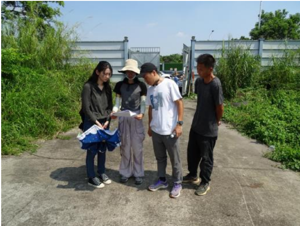
图 11 与工作人员确定地块范围（南-北）