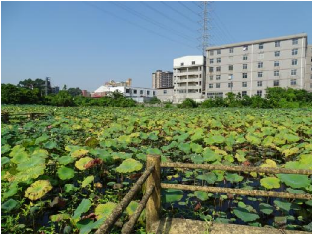
图 28 地块地表现状（西-东）