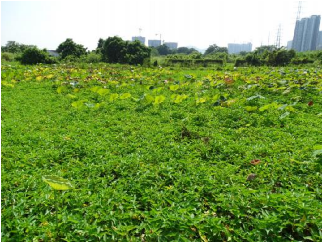
图 29 地块地表现状（北-南）