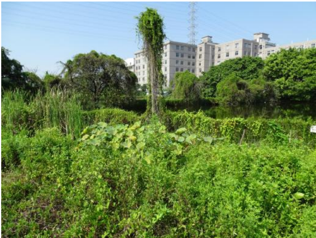
图 16 地块地表现状（西-东）