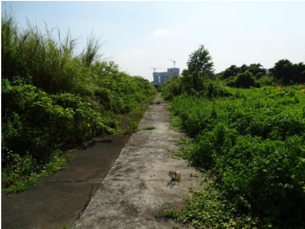
图 24 地块地表现状（东-西）