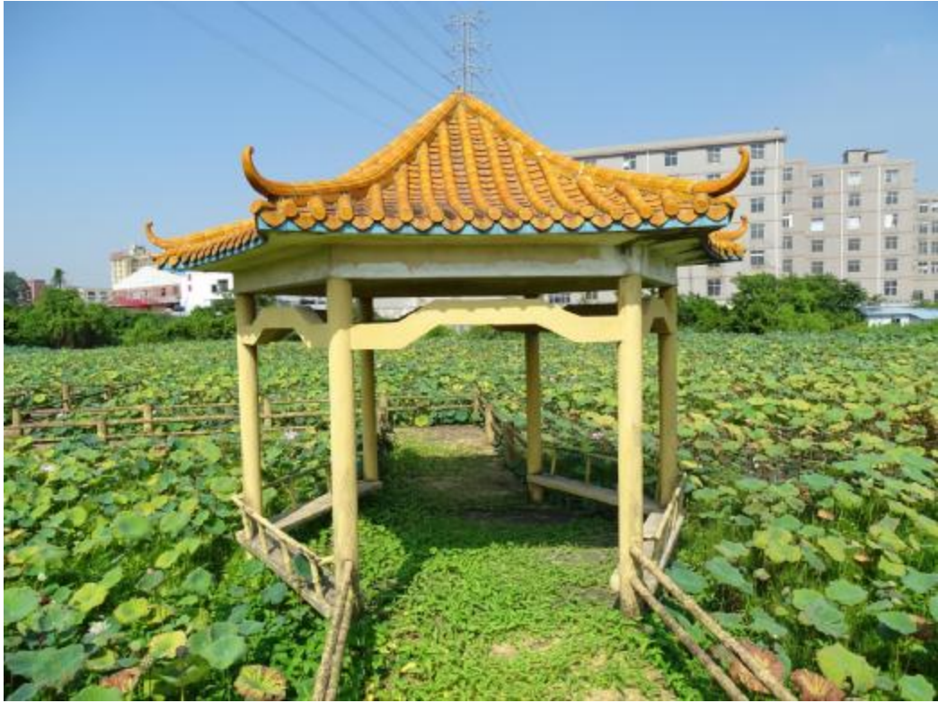
图 31 地块地表现状（西-东）