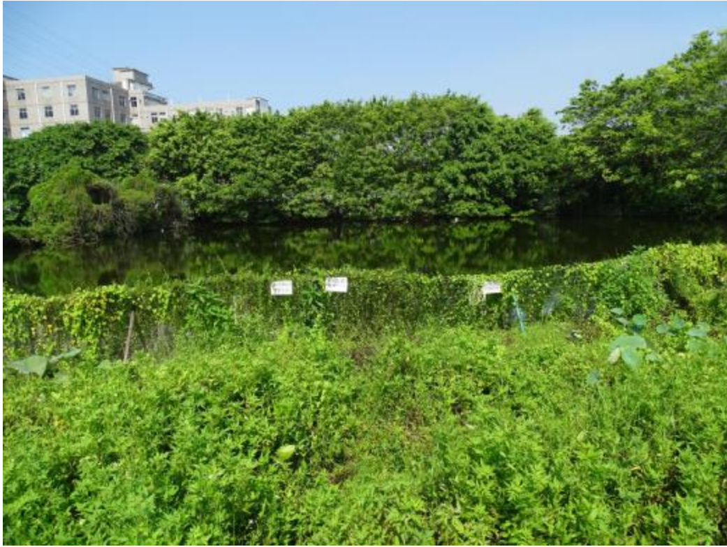
图 17 地块地表现状（西-东）