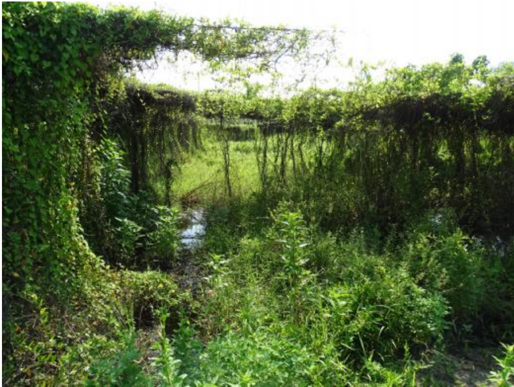
图 19 地块地表现状（东-西）