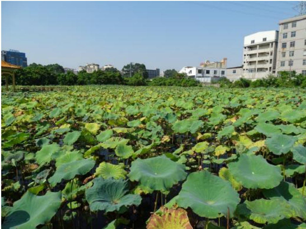
图 26 地块地表现状（北-南）