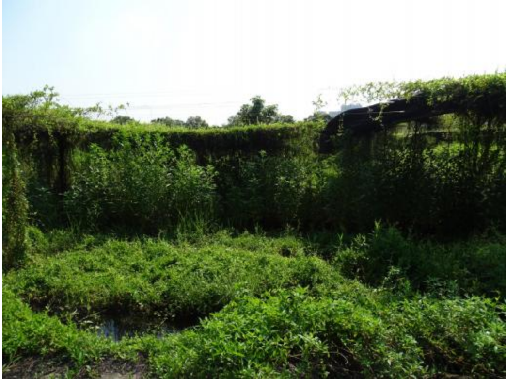
图 33 地块地表现状（东-西）