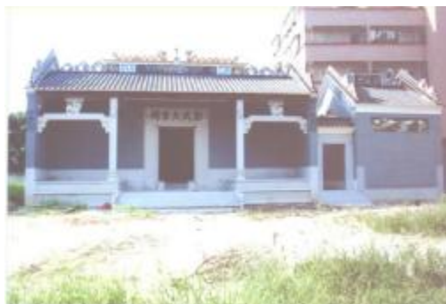
图 8 彭氏大宗祠

刘氏宗祠： 位于联边村彭上中心街，是彭上自然村刘姓族人的太公祠堂。始建于清光绪十年（1885），2004 年重修。坐西朝东，建筑占地面积 336 平方米。2010 年 12 月，公布为白云区第二批登记保护文物保护单位。