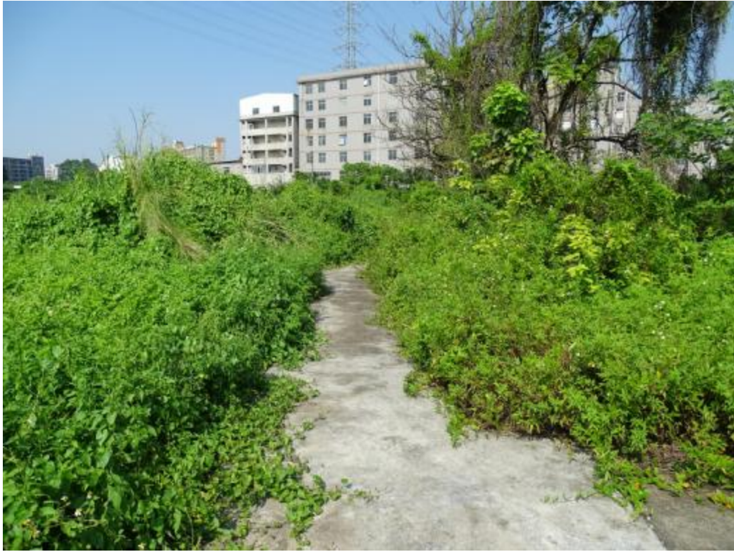
图 23 地块地表现状（西-东）