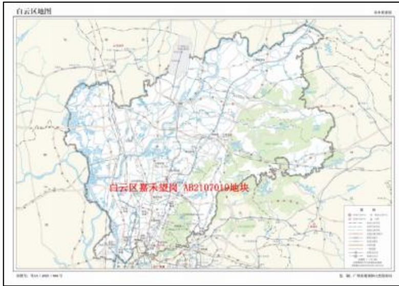
图 2 地块在白云区的位置示意图（广州市规划和自然资源局）