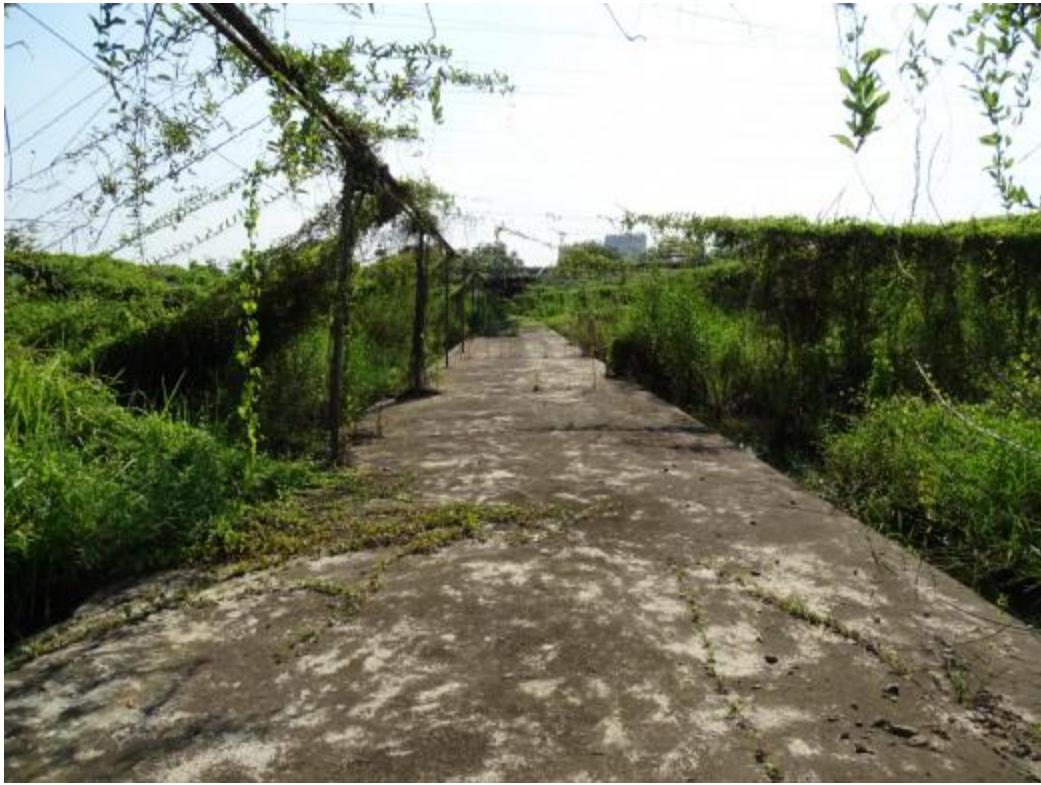
图 15 地块地表现状（东-西）