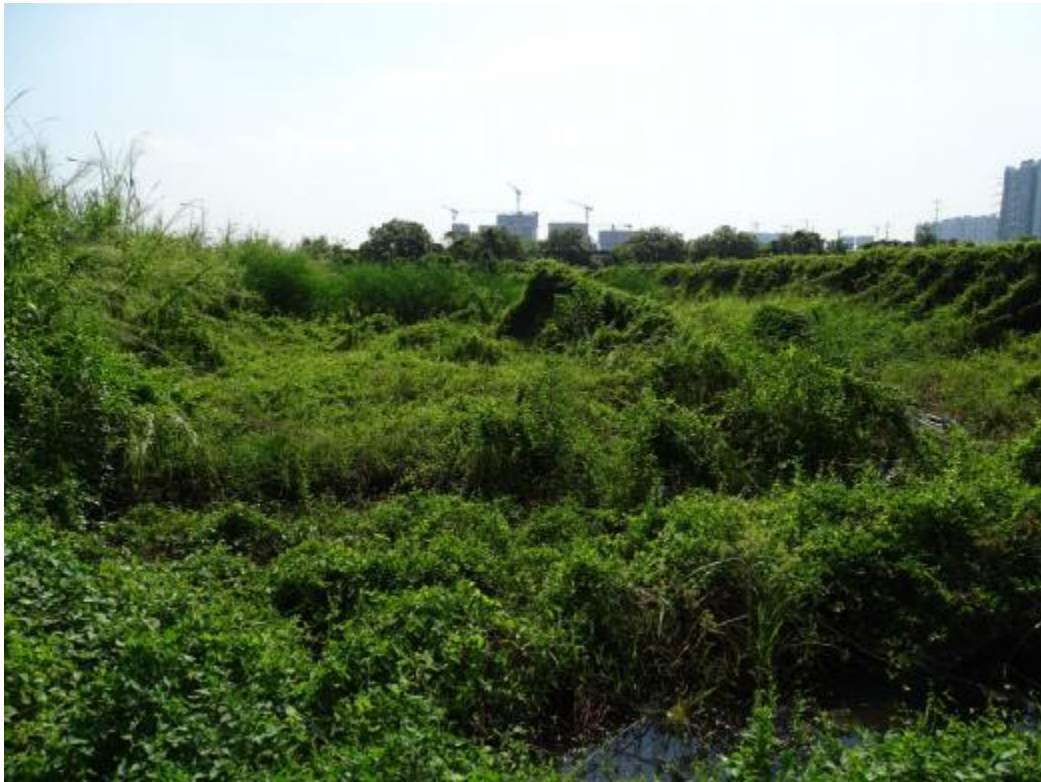
图 14 地块地表现状（东-西）