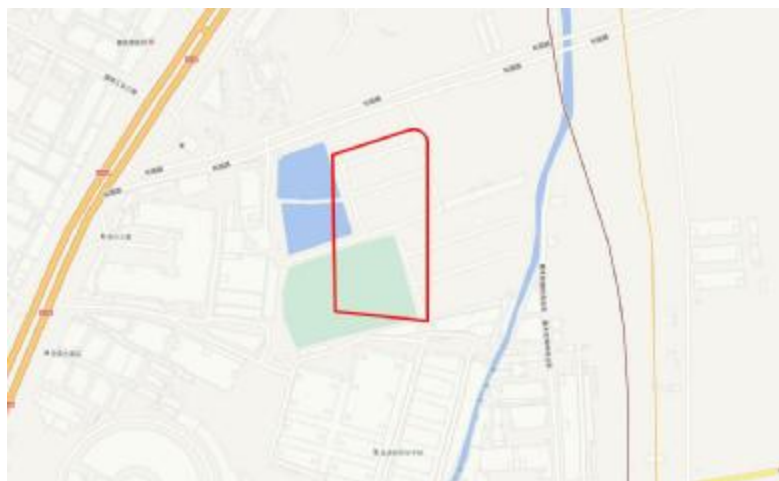
图 4 地块周边环境示意图（天地图）