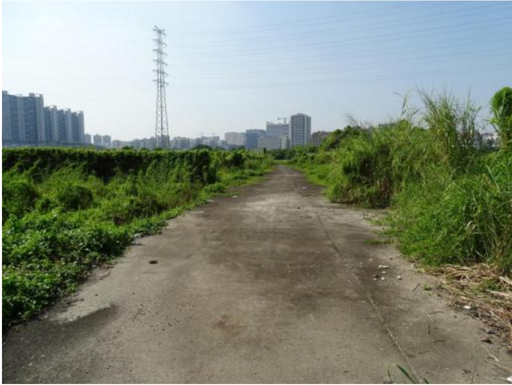
图 13 地块地表现状（北-南）