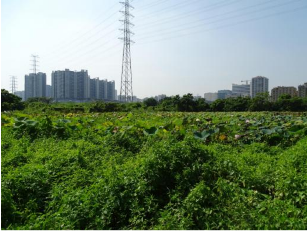
图 25 地块地表现状（北-南）