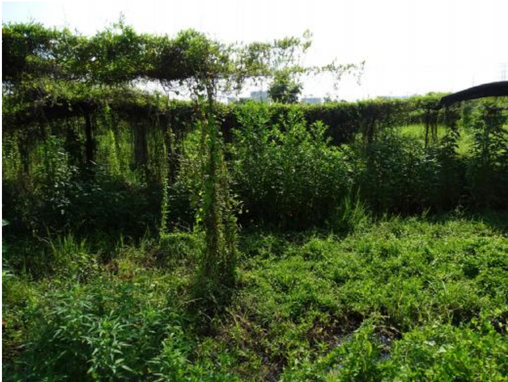
图 18 地块地表现状（东-西）