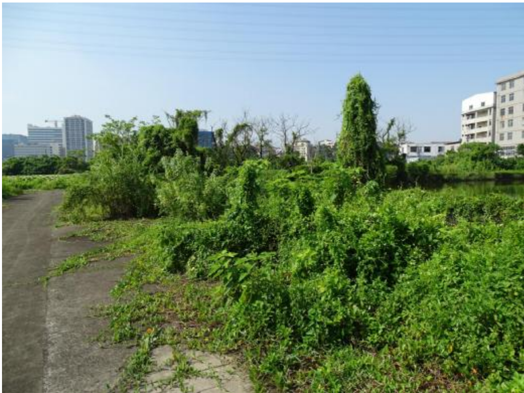
图 20 地块地表现状（北-南）