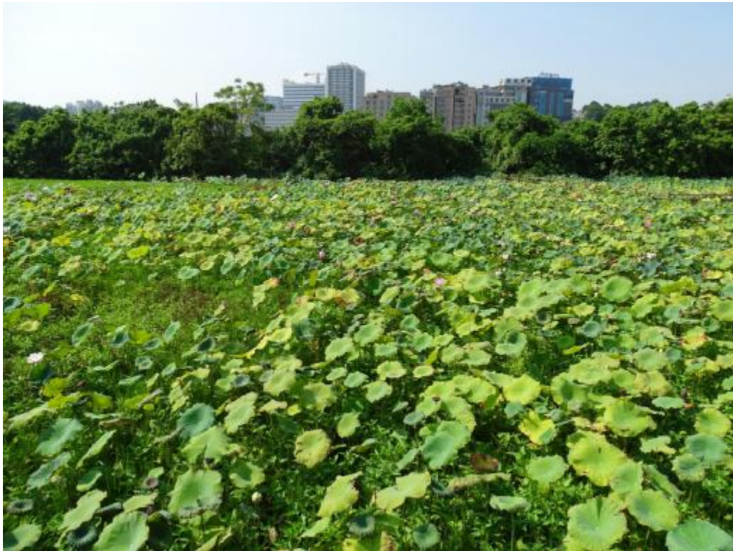
图 30 地块地表现状（北-南）