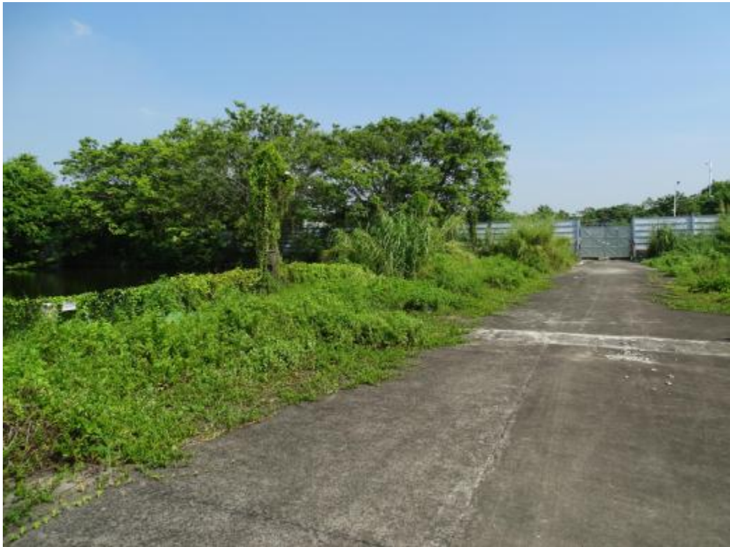
图 34 地块地表现状（南-北）