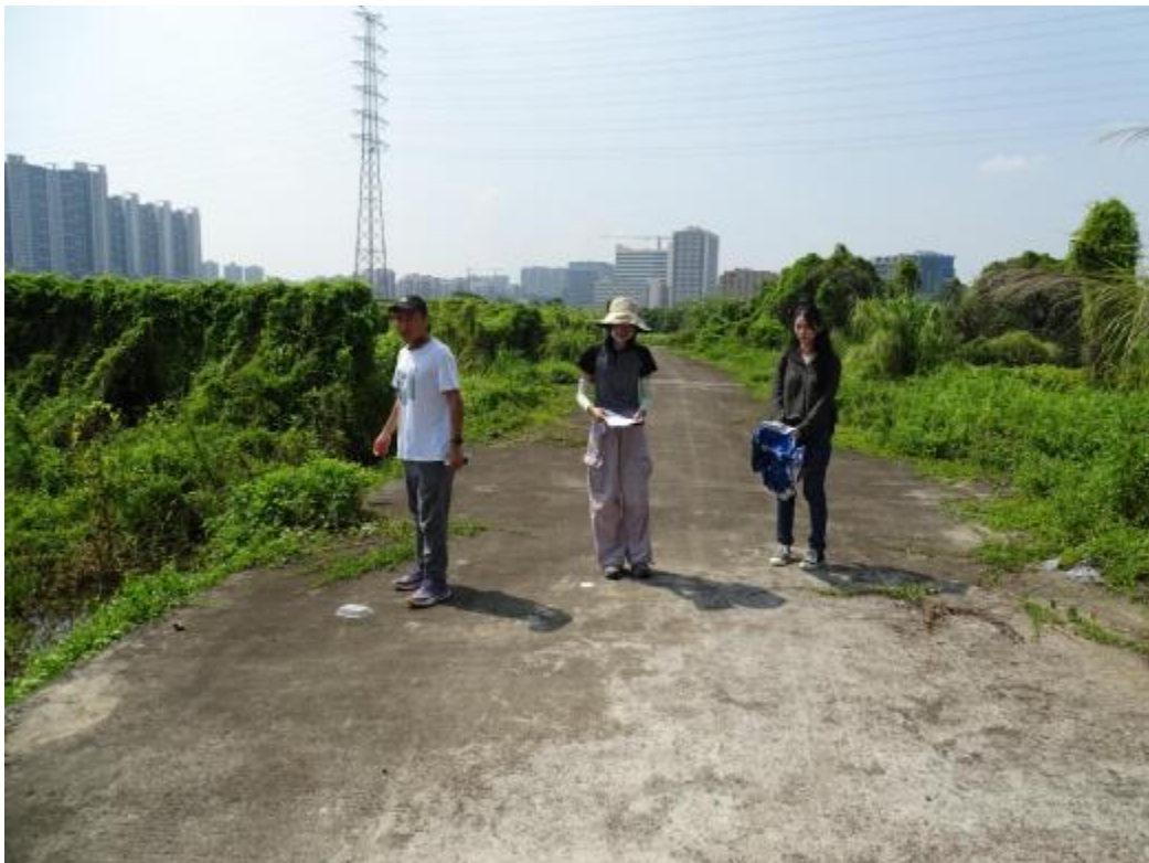
图 12 对地块地表进行踏查（北-南）