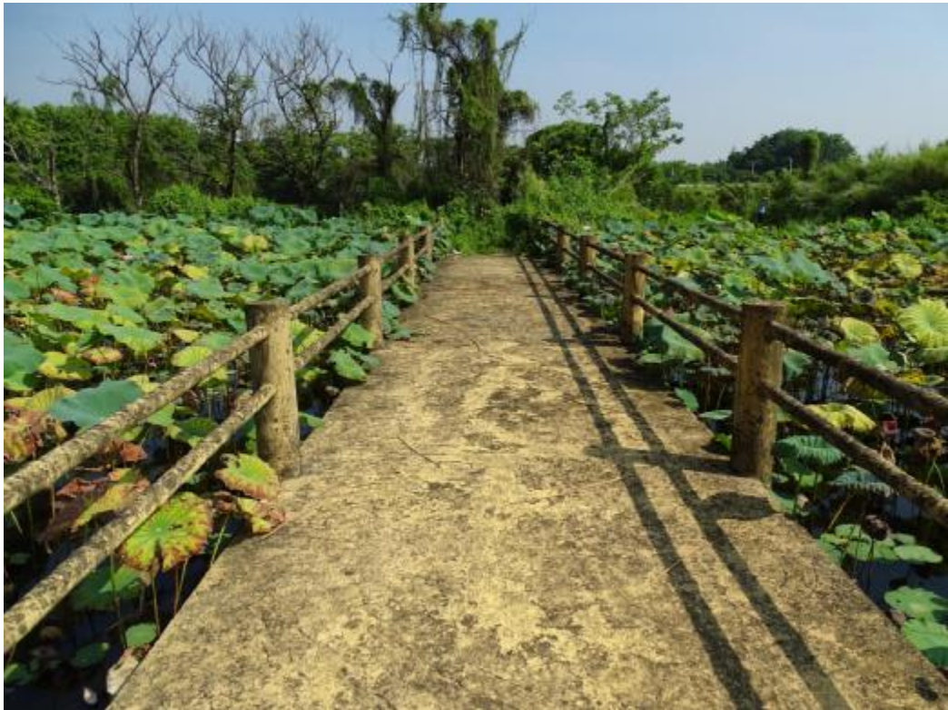
图 32 地块地表现状（南-北）