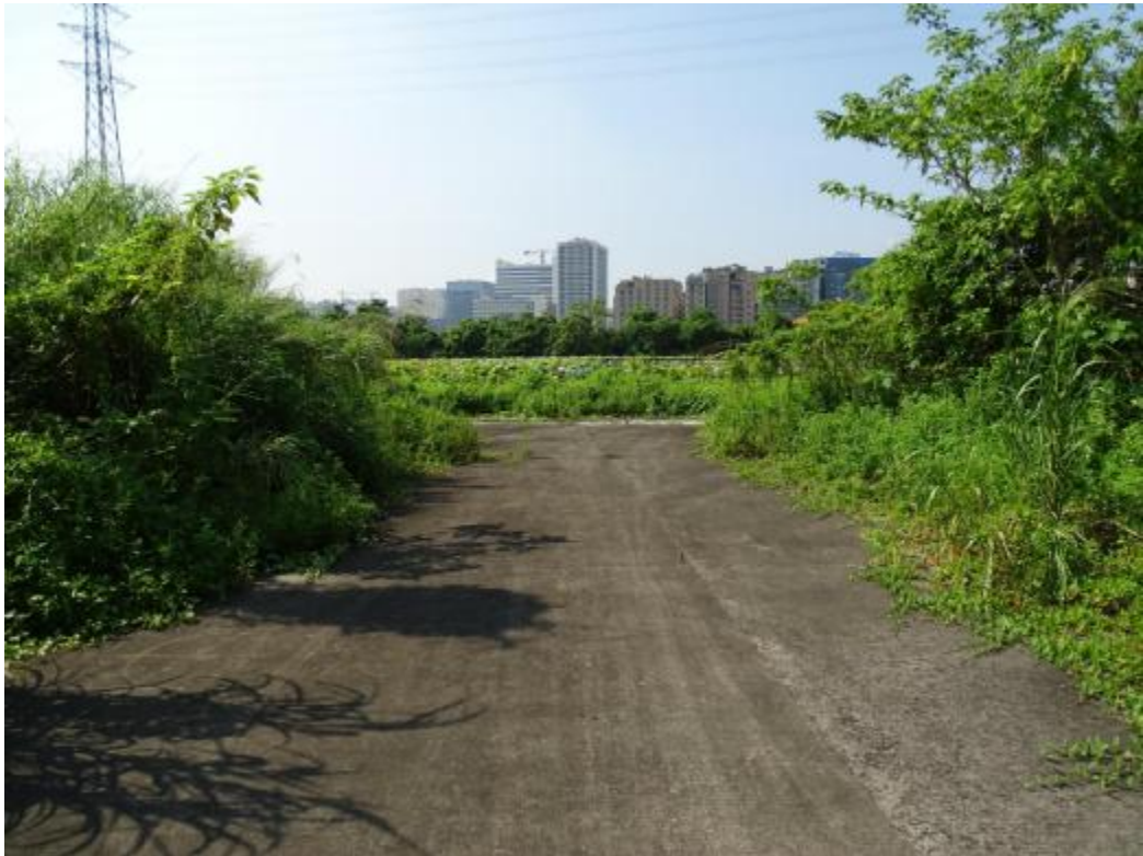
图 22 地块地表现状（北-南）