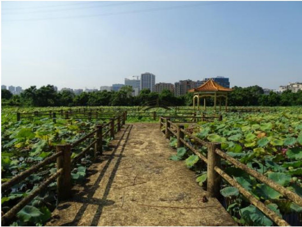
图 27 地块地表现状（北-南）