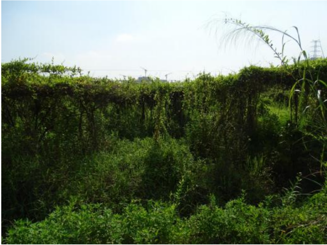
图 21 地块地表现状（东-西）