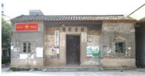
图 10 德士家塾