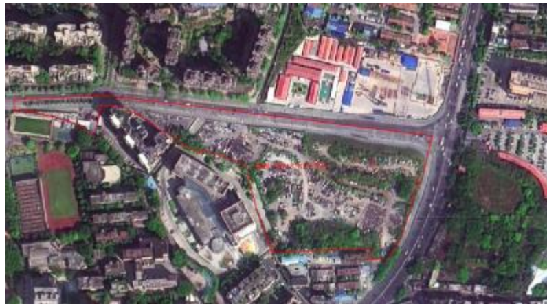
图 3 地块卫星红线图（业主范围提供）