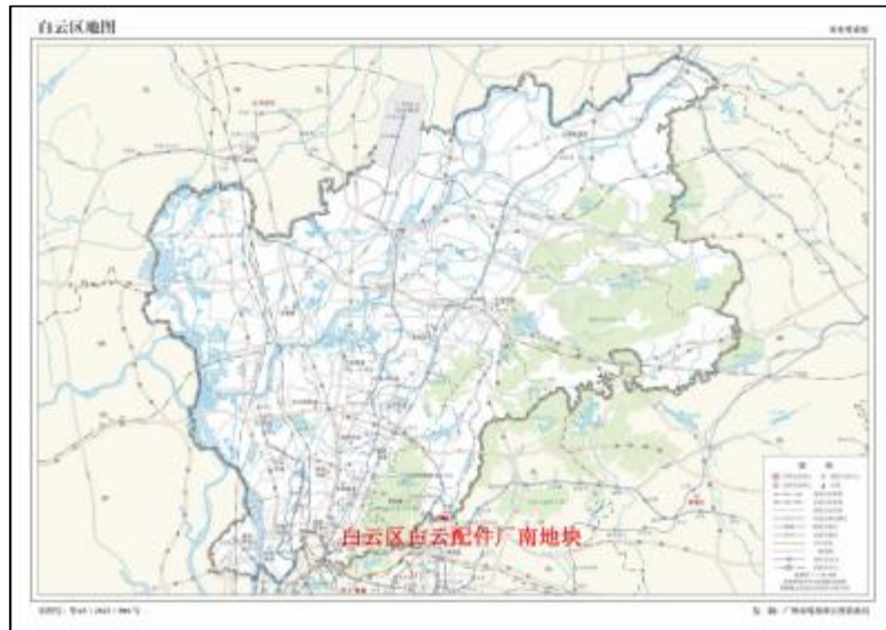
图 2 地块在白云区的位置示意图（广州市规划和自然资源局）