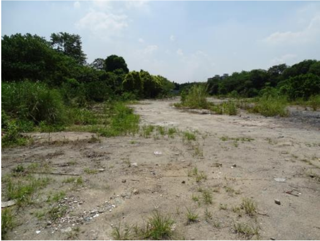
图 21 地块地表现状（西-东）