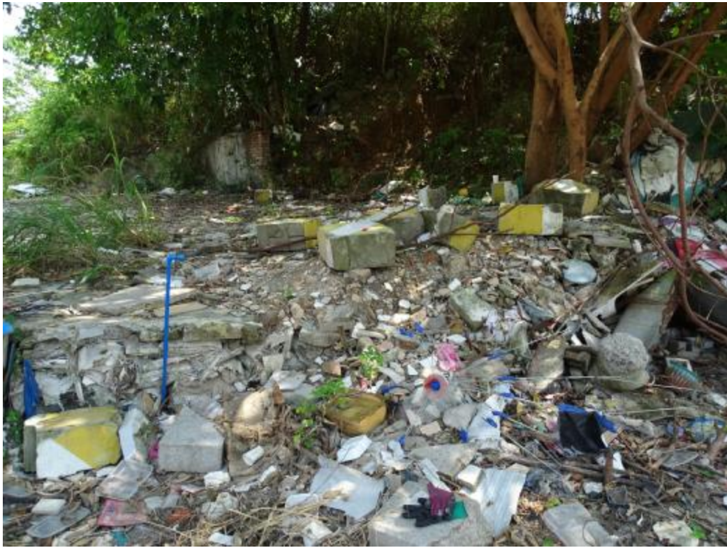
图 31 地块地表现状（南-北）