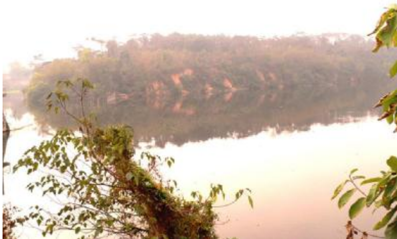
图 5 磨刀坑新石器时期文化遗存

磨刀坑新石器时期文化遗存： 位于广州北郊磨刀坑水库附近的小山岗上，发现石镞、石簇各 1 件和大量印纹陶片，以方格和米字纹纹饰的瓮、罐碎片为主，另有刻水波纹的小罐、组合纹的三足容器等。陶器制作年代约在战国至秦汉之间。