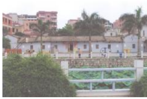
图 9 范家大屋

民国·古应芬墓： 位于地块东北部，其保护范围及建控地带延伸至地块内北部。古应芬墓墓园坐北朝南，由墓道、石狮、门楼、墓冢、墓碑组成，四周建有围墙，占地面积 2760 平方米。墓门左侧镶嵌铭碑，碑上刻“古应芬先生墓园 广州市人民政府重建，一九八七年八月三日。”沿墓道入，两侧各立一连州青石狮；门楼二层，歇山顶，宝蓝色琉璃瓦顶，椽子端分别刻以“古”字图案贴黄色条砖。面阔三间 11.4 米，进深一间 6.7 米，钢筋水泥结构，明间开拱门洞贯通前后。墓冢呈半球形，花岗岩石砌筑，前立墓碑，阴刻楷书“古应芬先生之墓 一九八七年吉日立”。墓冢后立有记载墓主生平的青石碑，宽 1.85 米，高 3.7 米，碑座高 0.60 米。墓额为云海宝珠顶，碑首刻：“国民政府委员古公之墓”，落款为：“中华民国二十年十一月，国民政府监建，番禺胡汉民撰，番禺陈融书。”墓园曾遭破坏，1987 年由广州市人民政府参照原貌重建。2002 年 7 月 8 日该墓被公布为广州市第六批文物保护单位。