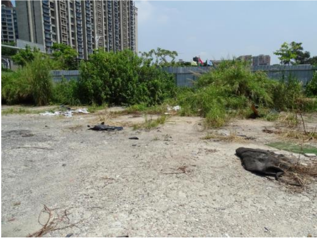
图 33 地块地表现状（南-北）