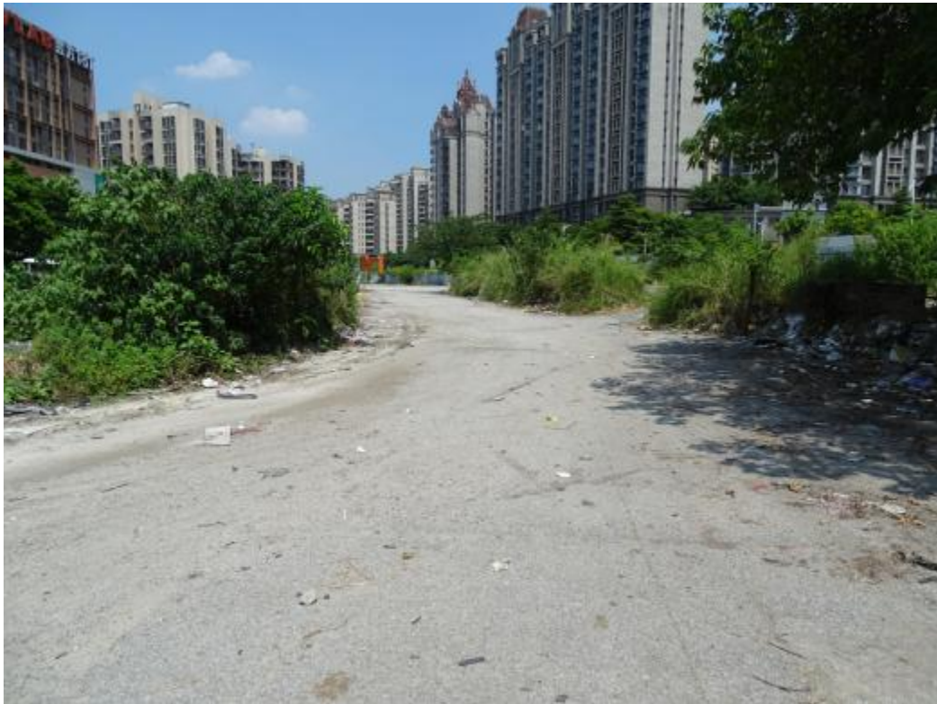
图 30 地块地表现状（东-西）