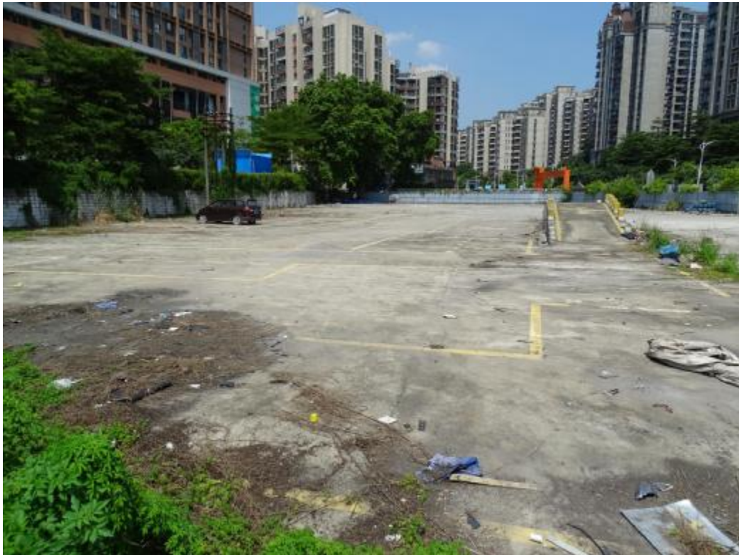
图 22 地块地表现状（东-西）