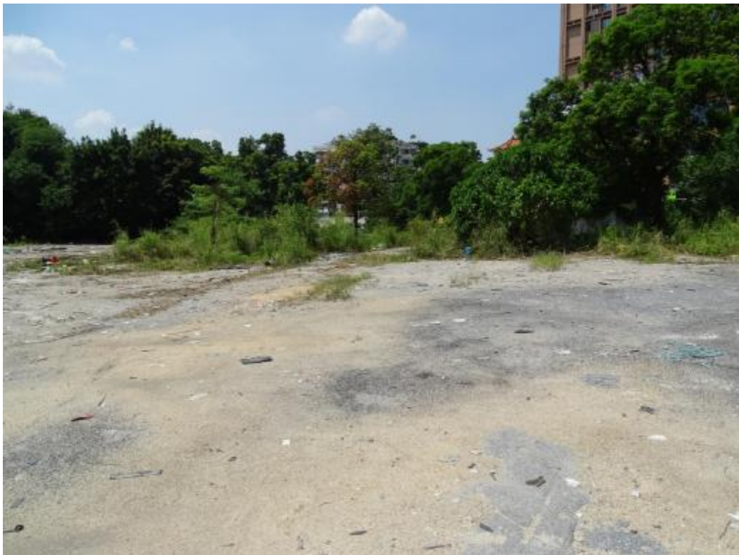
图 28 地块地表现状（北-南）