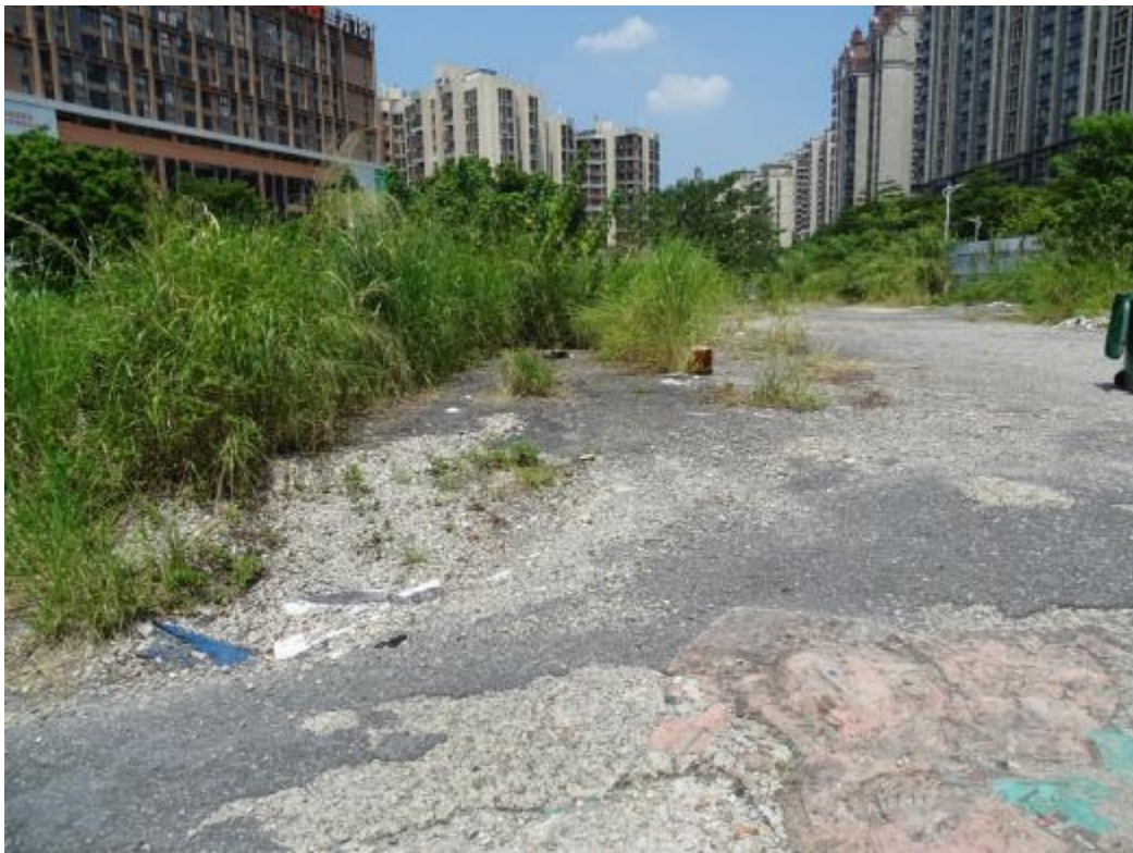
图 32 地块地表现状（东-西）