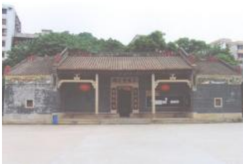
图 6 其明何公祠

何人鉴家族墓： 位于同和街握山村，始建于南宋咸淳三年（1267 年），历代有重修，已改为清代形制抄手墓。该墓群坐南朝北，并列四座，其中右二是何德明之墓，右三是其继室叶氏之墓，右一为其长媳陈氏之墓，右四为其三媳蔡氏之墓。总宽 46 米，纵深 25.6 米，占地面积 1177.6 平方米。四墓均为山手交椅形制，由坟头、护岭、山手、拜桌、平台、华表组成。2018 年被公布为广州市文物保护单位。