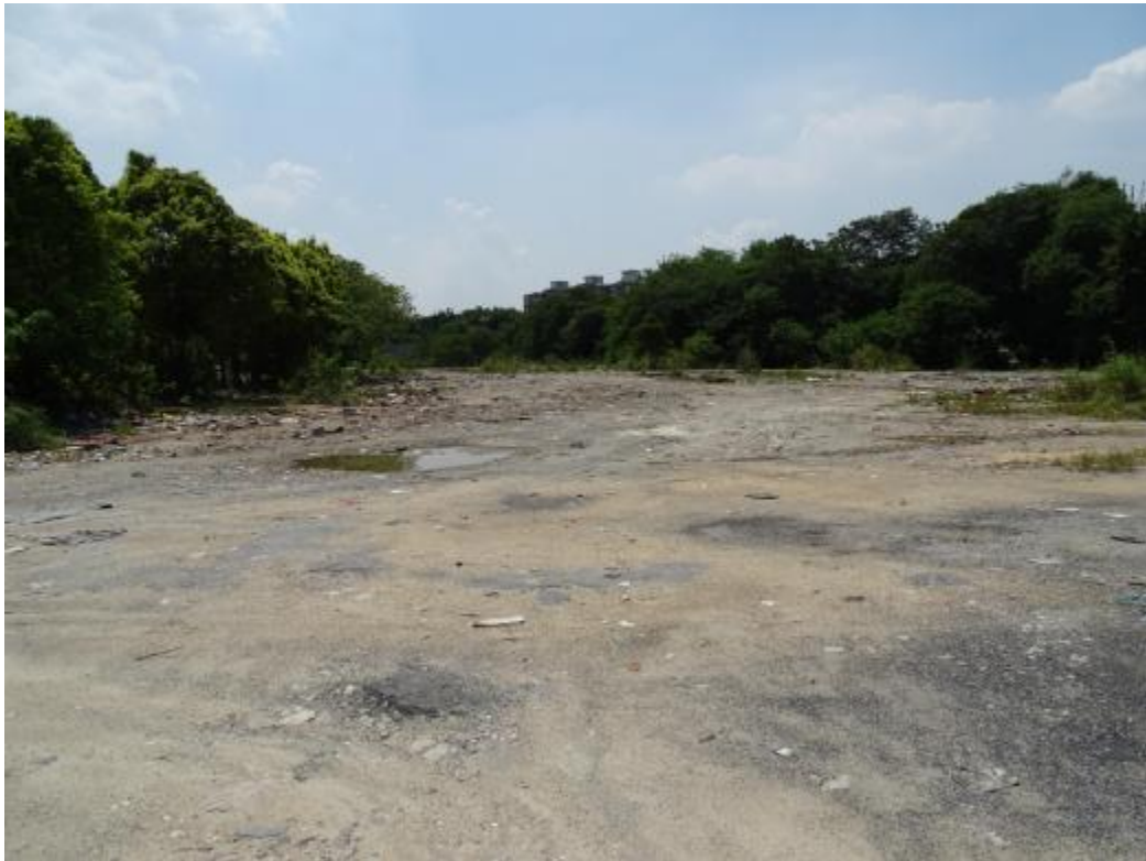
图 26 地块地表现状（西-东）