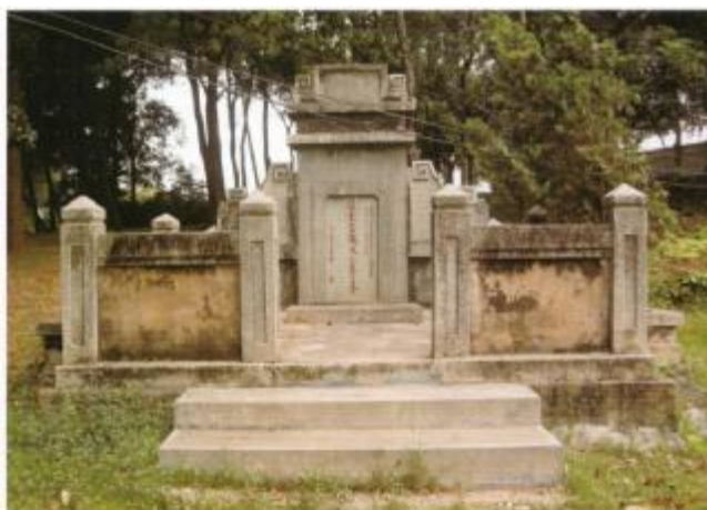
图 15 李铁夫墓

李铁夫墓： 位于天河区兴华街建武社区居委会。建于 1958 年 1 月，坐北朝南，四周有高 1 米的石柱栏杆围绕，清雅肃穆。墓所在广州市银河烈士陵园位于燕岭路东侧银锭塘村旁，因地处银河乡而得名，1956 年建成，遍种苍松翠柏，有人工湖、六角亭等，宁静幽雅。花岗岩墓碑立于墓地末端，水刷石米批荡。下镶墓碑，上刻“画家李铁夫先生之墓”。上款“华南文学艺术界联合会副主席 一八六九年生一九五二年逝世”，下款“一九五八年一月立”。墓碑前有拜桌。该墓形制完整，墓碑清晰，保存状况好。墓四周树木茂盛。2009 年 7 月，公布为天河区文物保护单位。