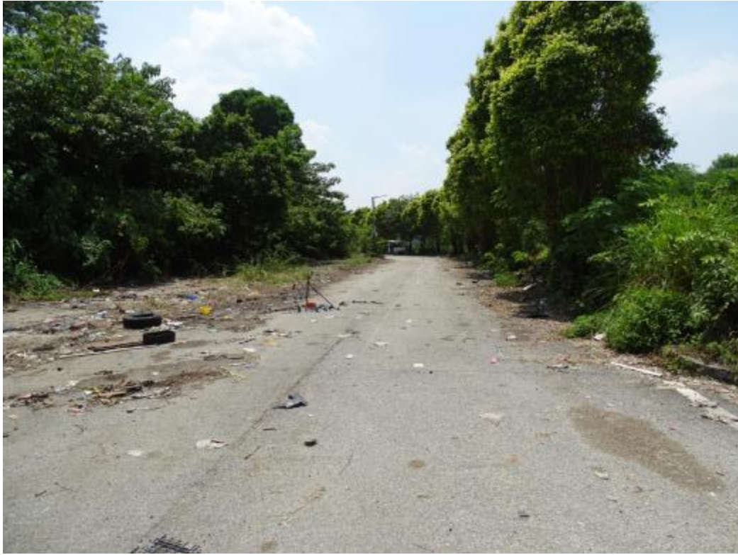
图 29 地块地表现状（西-东）