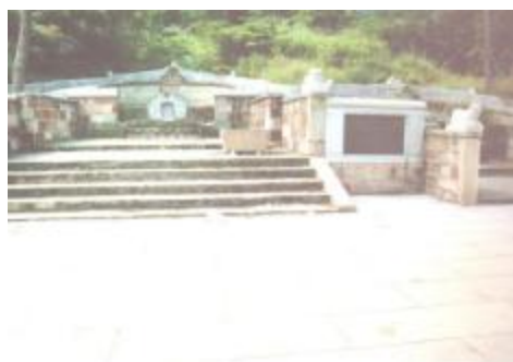
图 7 何人鉴家族墓

白鸽窠老井： 距地块西部约 700 米，位于白云区同和街握山村。握山村土名白鸽窠，故当地人称该井为白鸽窠老井。据当地长者讲述，水井开挖于清乾隆初年。井深 5 米，井内直径 1.3 米，井台为方形，边长 4.5 米。井泉位于白云山东面山脚下，四周为民居，保存尚好。2010 年 12 月被公布为白云区登记保护文物保护单位。