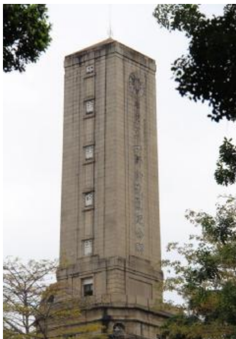
图 13 粤军第一师诸先烈纪念碑

粤军第一师为孙中山于民国 9 年（1920）底组建，民国 14 年扩编为国民革命军第四军，先后参加东征陈炯明和北伐战争，屡立战功，有“铁军”之誉。牛眠岗一带原为粤军第一师及扩编后第四军的阵亡将士坟场。“文化大革命”期间，坟场基本平毁，只余此纪念碑，碑上国民党国徽及碑文亦被凿平。1986 年，广州市人民政府重修该碑。2002 年 7 月公布为广州市文物保护单位。