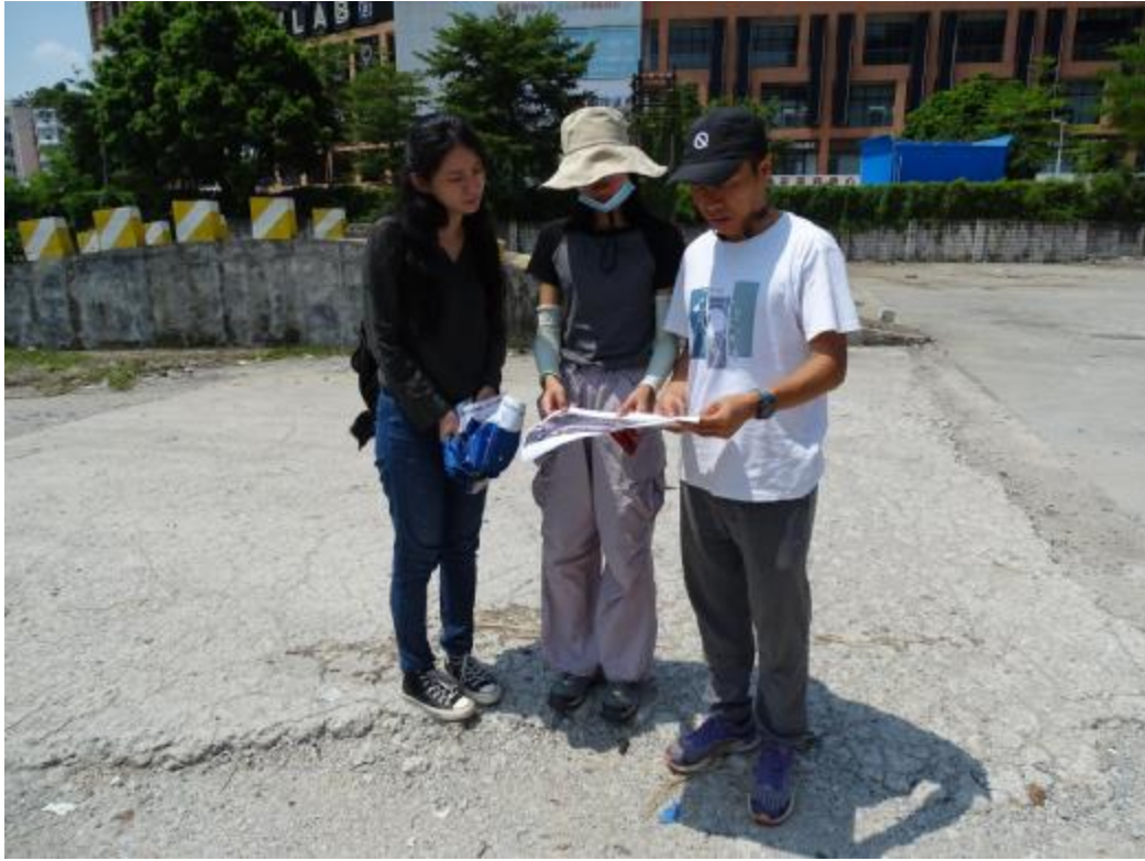
图 17 与工作人员确定地块范围（北-南）