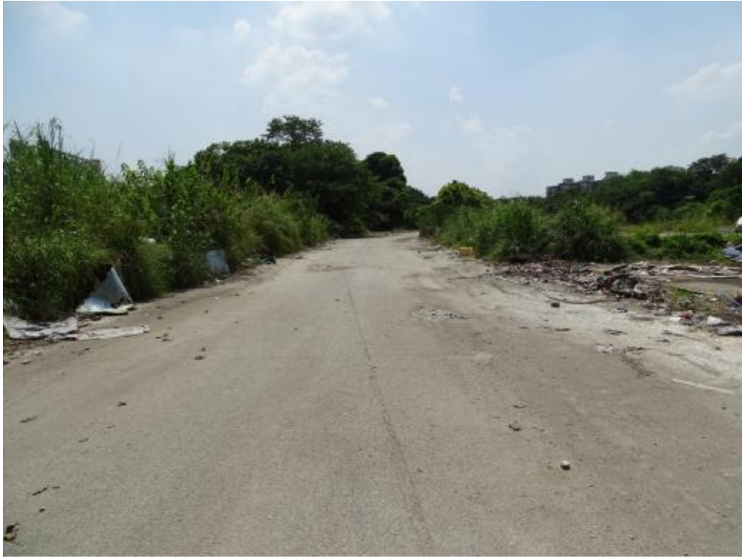
图 19 地块地表现状（西-东）