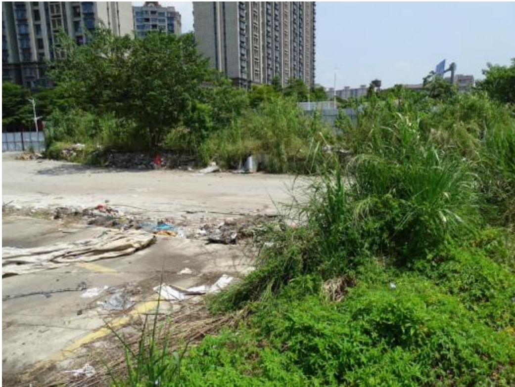
图 23 地块地表现状（南-北）