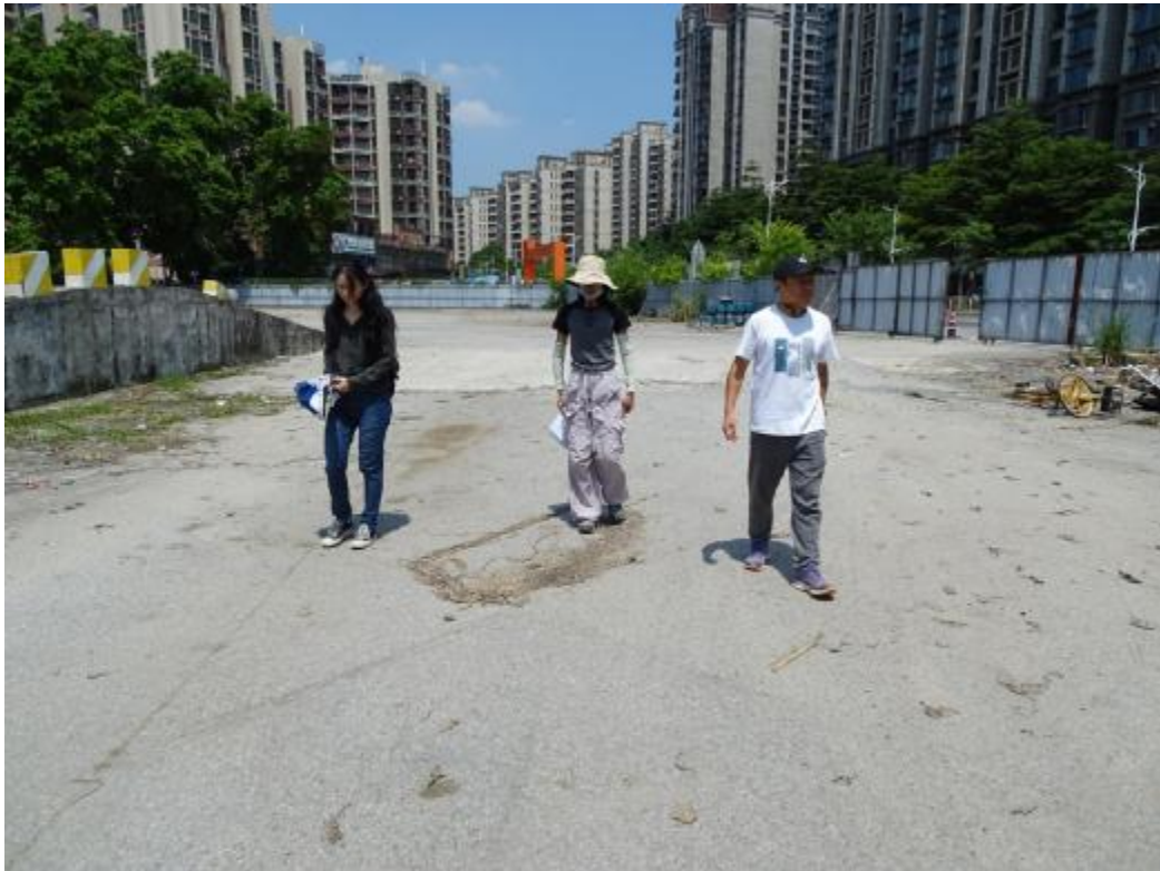
图 18 对地块地表进行踏查（东-西）