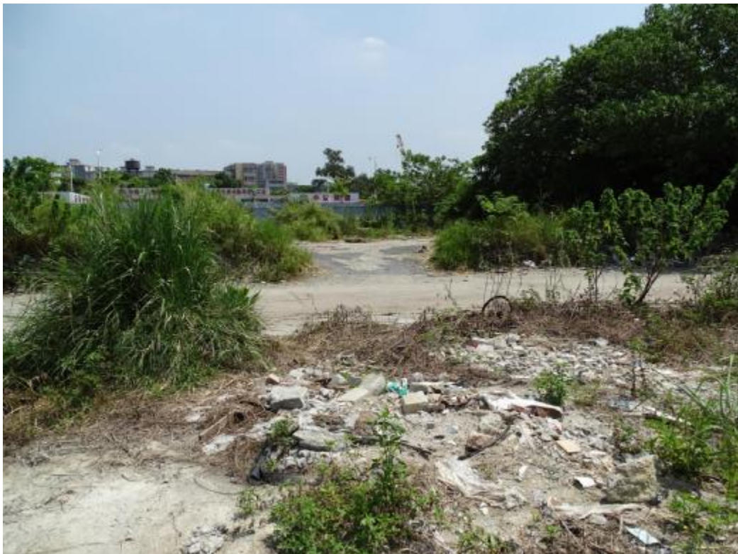
图 24 地块地表现状（南-北）