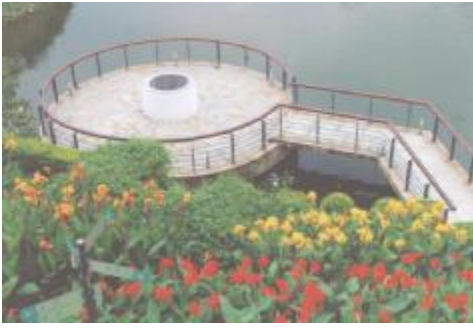
图 8 斯文井远视图