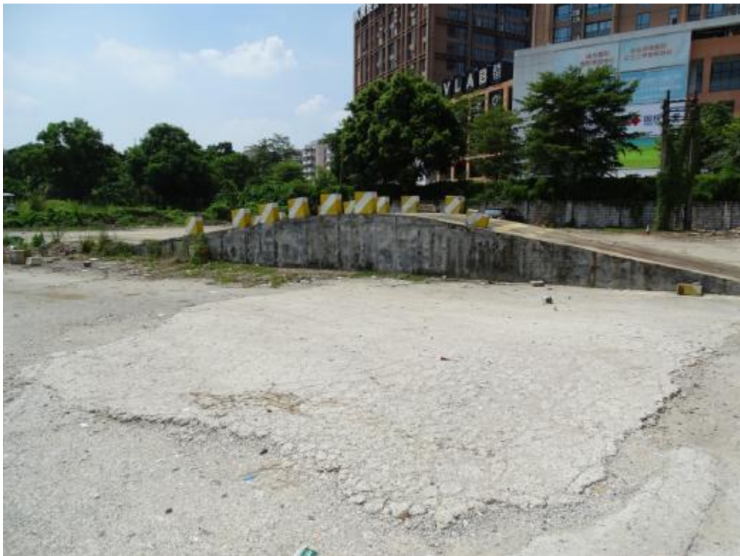
图 36 地块地表现状（北-南）