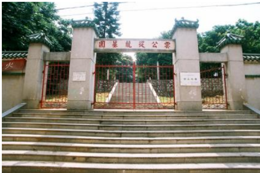
图 12 云从龙墓墓门

云从龙墓： 位于广东省广州市天河区兴华街道白云山后峰梅岭蝮蛇坑，始建于元元贞二年（1296），历经明、清、近代等多次重修。坐西北朝东南。墓园右前方有云家山藏碑亭。墓道东西两侧各有 1 座牌坊。2002 年 7 月公布为广州市文物保护单位，2008 年 11 月公布为广东省文物保护单位。