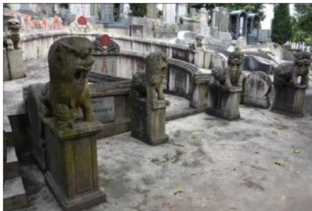
图 14 杨西岩夫妇合葬墓

日”，左边下款刻“祀男必达、瑞芝、惠林、怀仁、康乐、益华，孙兆均、启光、兆铭、茂泰、启荣、茂吾等立”。墓前有青石拜桌。山手的左右两边挂榜处立有两只石狮，形态逼真，下面有基座，高约 80 厘米。2009 年 7 月公布为广州市文物保护单位。