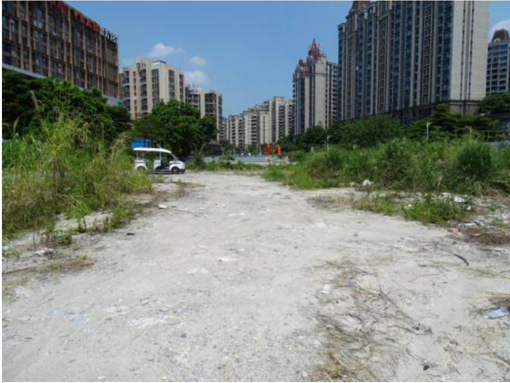
图 25 地块地表现状（东-西）