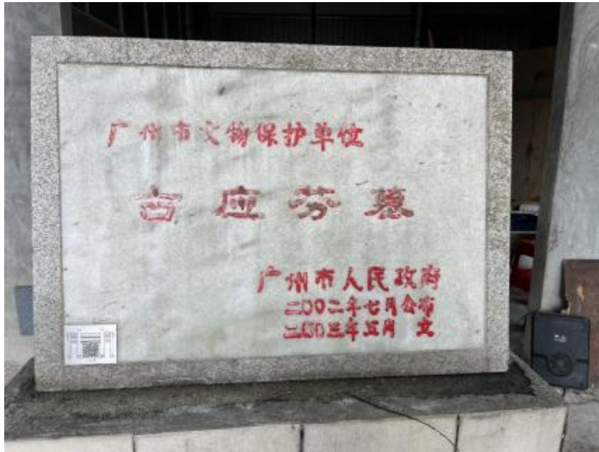
图 11 古应芬墓

云从龙墓： 位于广东省广州市天河区兴华街道白云山后峰梅岭蝮蛇坑，始建于元元贞二年（1296），历经明、清、近代等多次重修。坐西北朝东南。墓园右前方有云家山藏碑亭。墓道东西两侧各有 1 座牌坊。2002 年 7 月公布为广州市文物保护单位，2008 年 11 月公布为广东省文物保护单位。