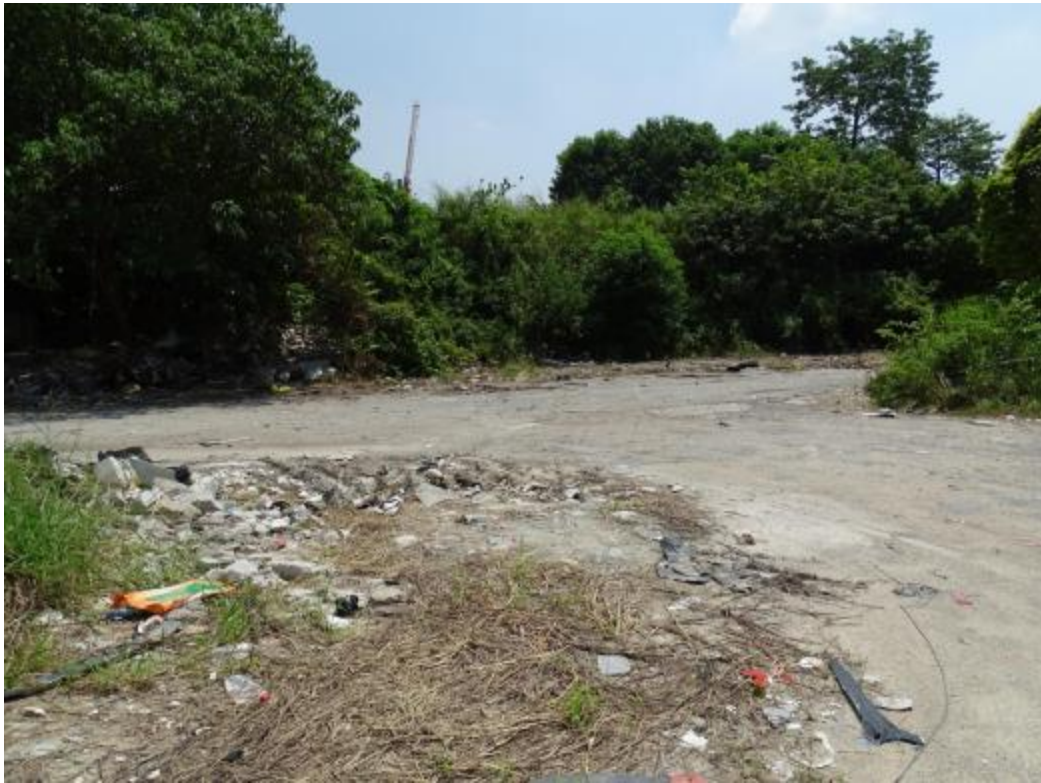
图 27 地块地表现状（西-东）