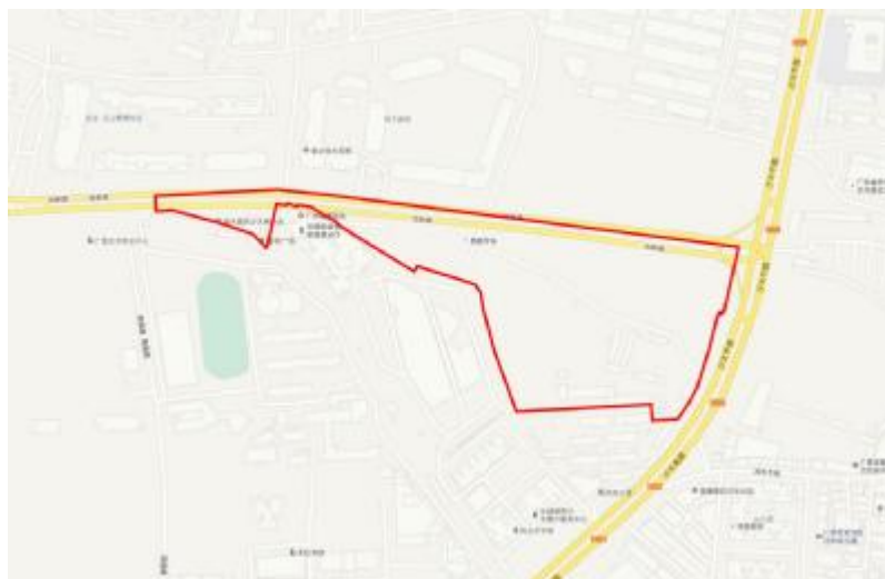
图 4 地块周边环境示意图（天地图）