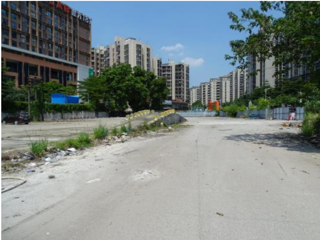
图 34 地块地表现状（东-西）