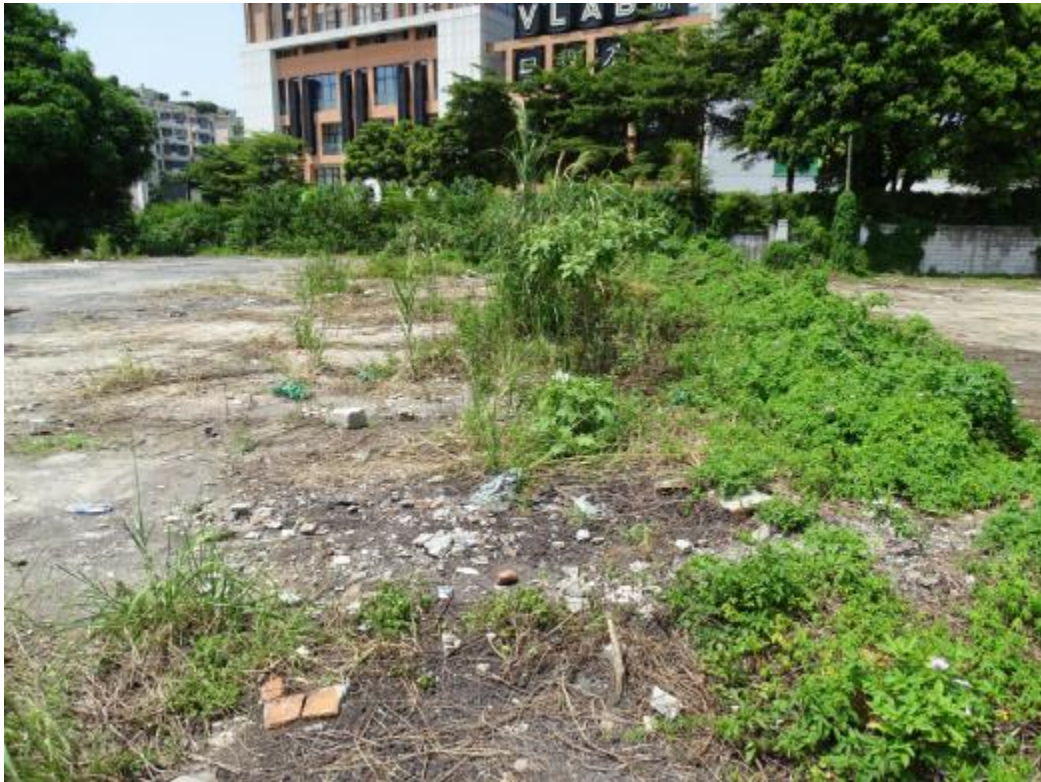
图 20 地块地表现状（北-南）