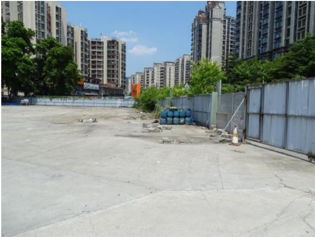
图 35 地块地表现状（东-西）