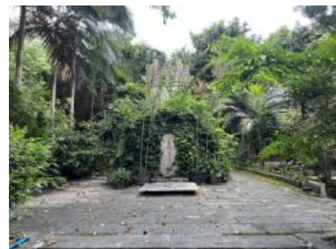
图 10 古应芬墓园（南-北）