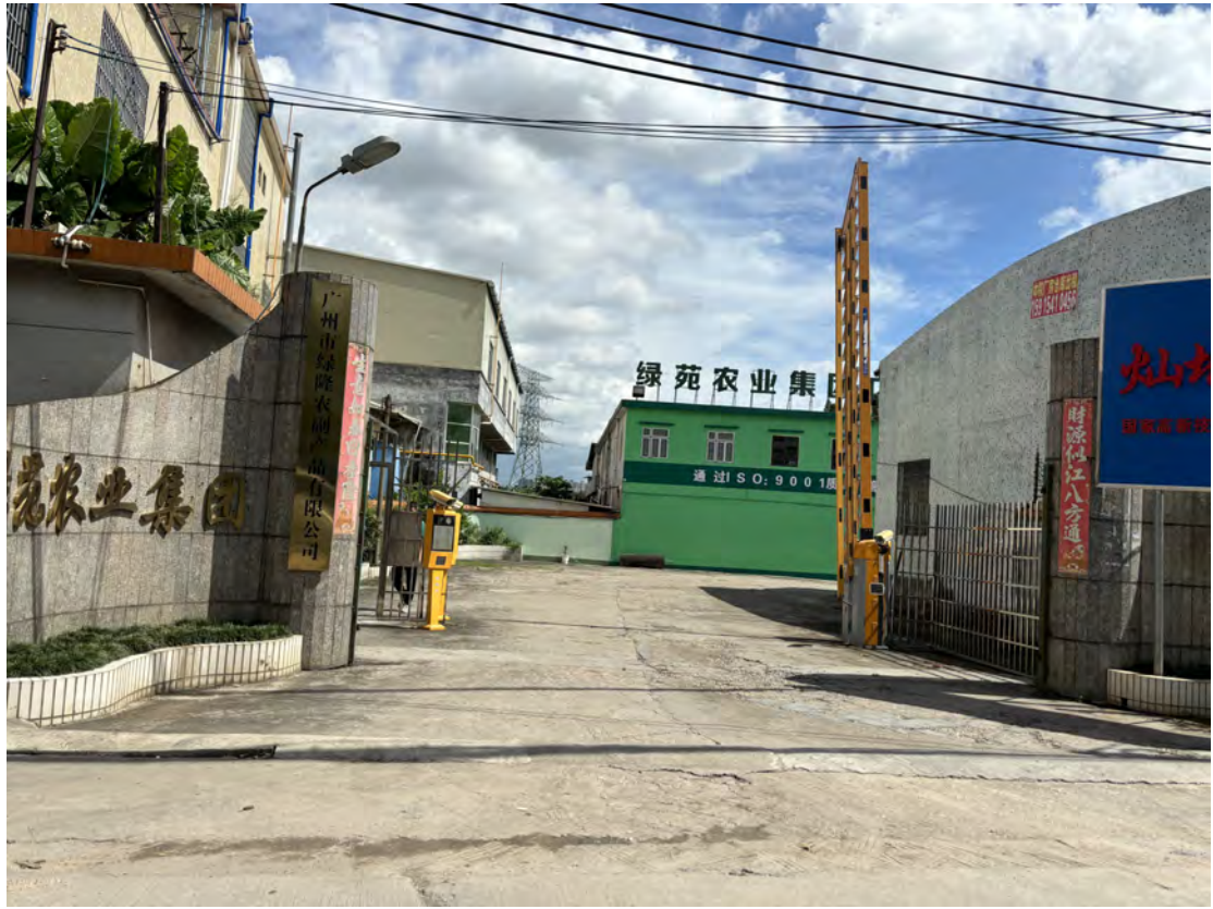
图 18 地块北部现状（南-北）