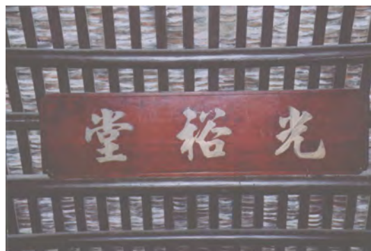
图 9 伍氏大宗祠“光裕堂”木扁额

邝氏宗祠: 位于白云区江高镇大龙头村龙头东街，是该村邝姓族人的太公祠。始建年代不详，重建于清咸丰年间，2002 年重修。硬山顶，人字山墙，灰塑博古脊，碌灰筒瓦，绿色陶瓦当剪边。青砖砌墙，红砂岩墙脚。该祠坐西朝东，三间两进，总面阔 12.3 米，总进深 24.4 米，建筑占地面积 420.66 平方米。祠前有地坪，面积约 500 平方米。坪前是池塘，水面积约 500 平方米。