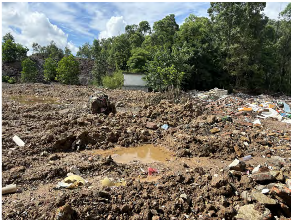
图 38 地块南部现状（北-南）