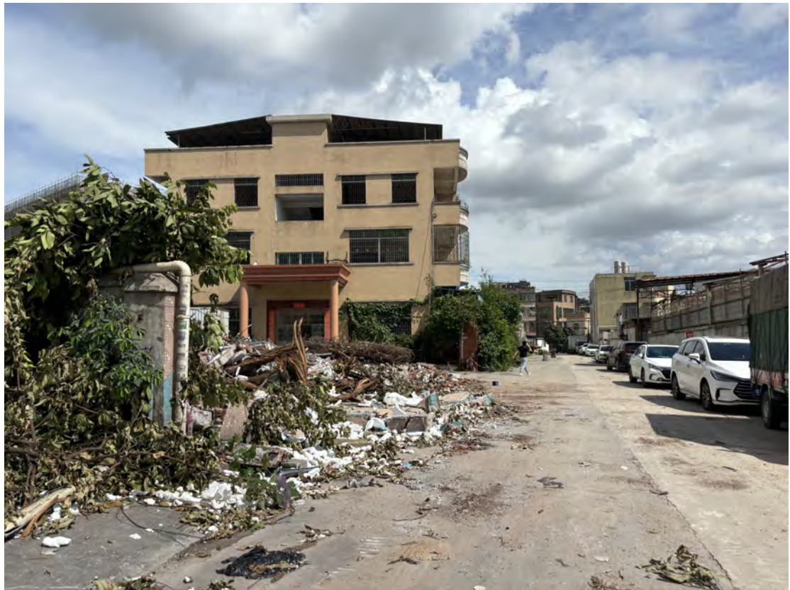
图 43 地块西部现状（东-西）