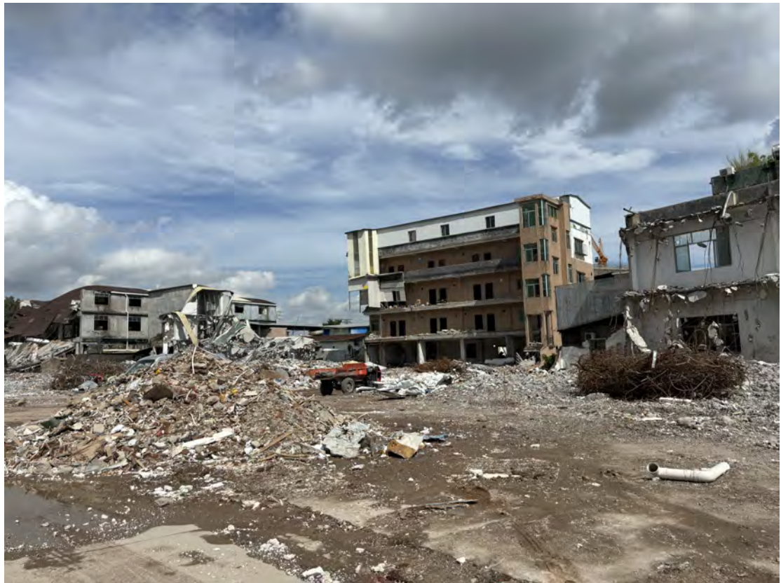
图 27 地块南部现状（南-北）