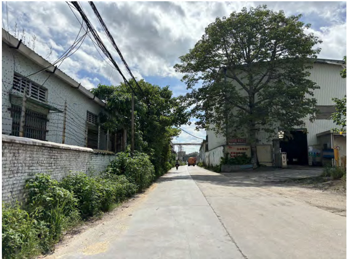
图 19 地块北部现状（西-东）