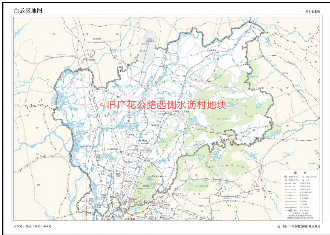
图 2 地块在白云区的位置示意图 (广州市规划和自然资源局)