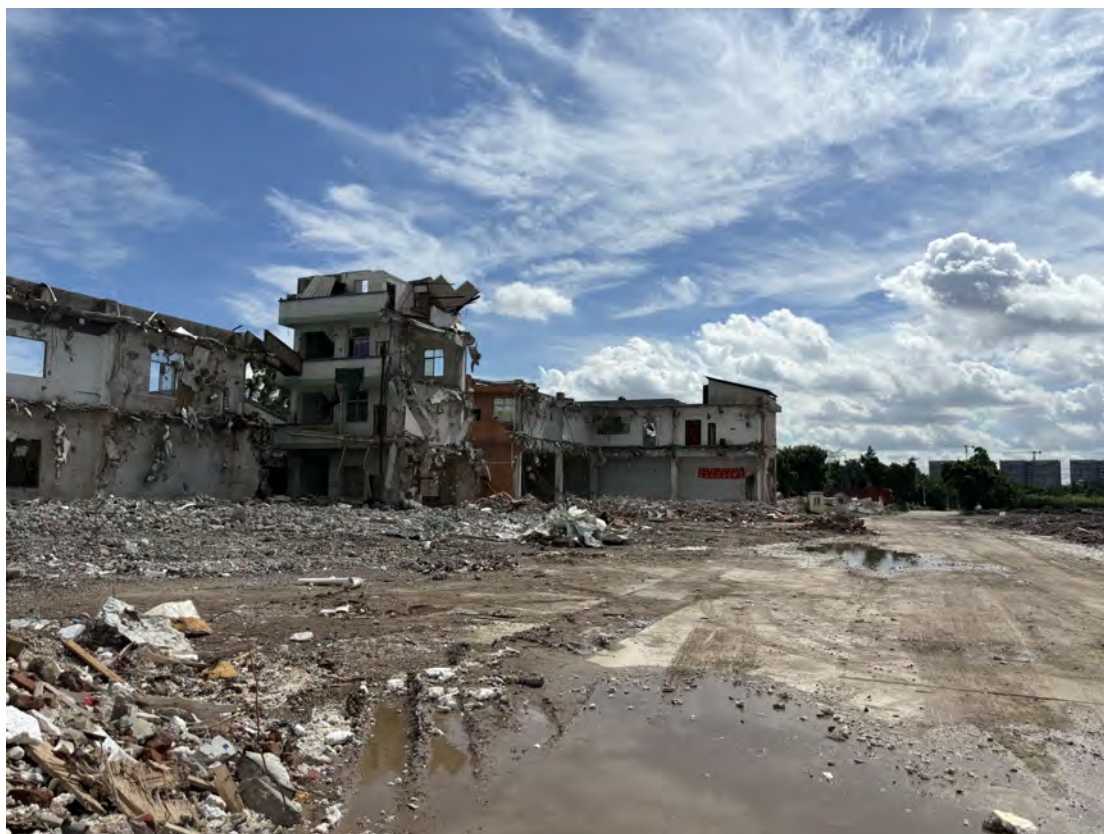
图 29 地块南部现状（西-东）