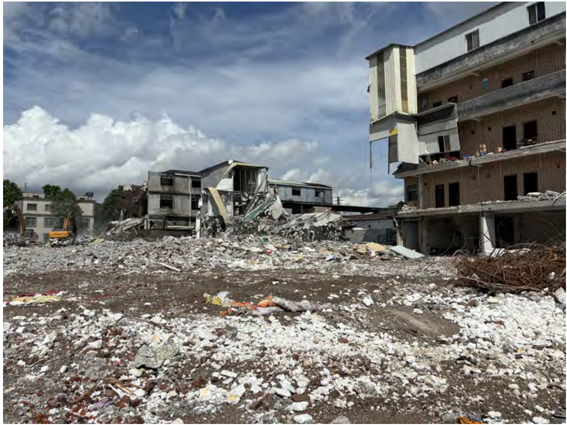
图 42 地块西部现状（东-西）