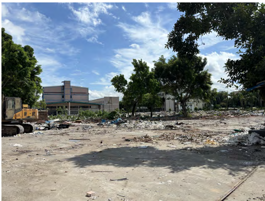
图 41 地块南部现状（南-北）