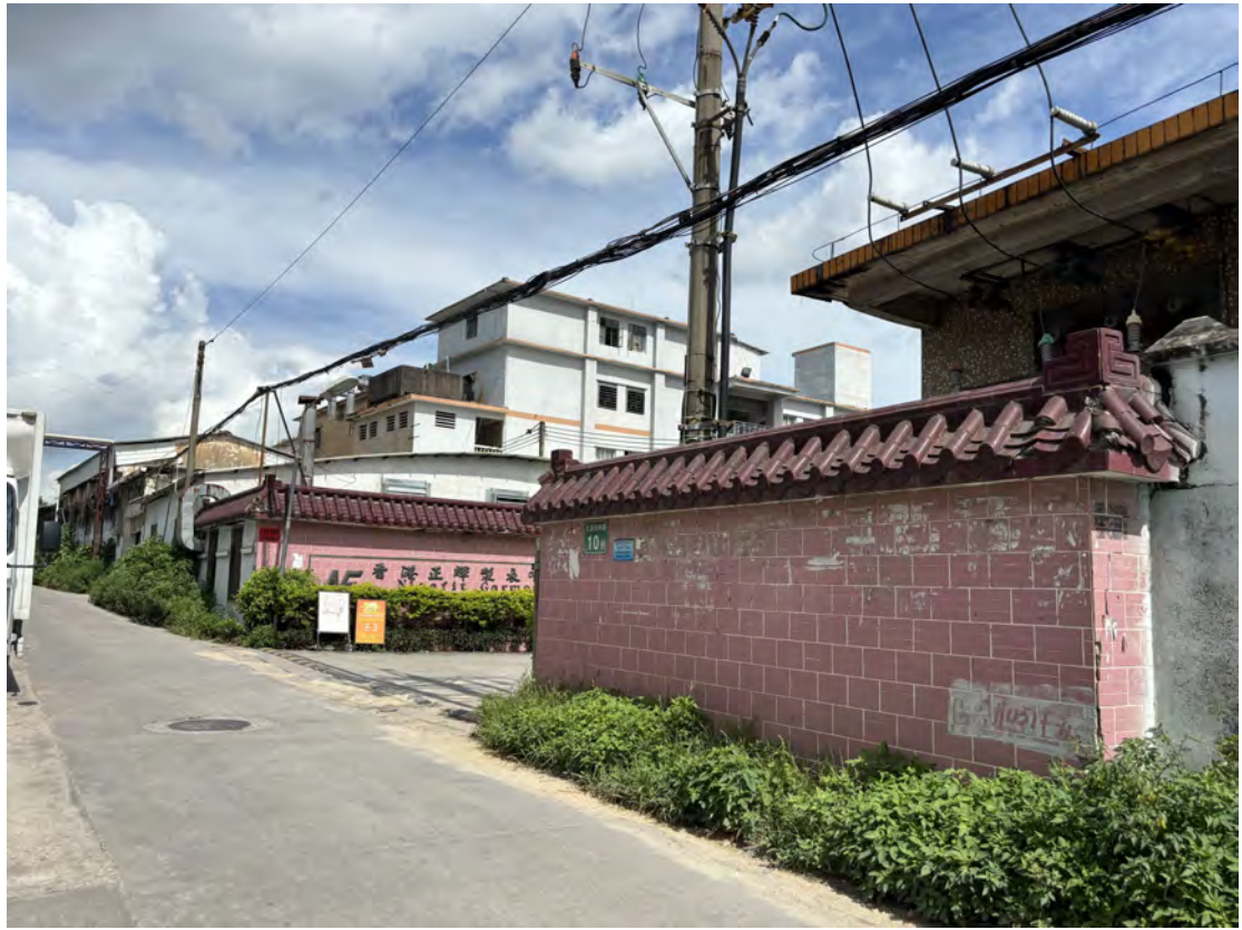
图 22 地块北部现状（东-西）