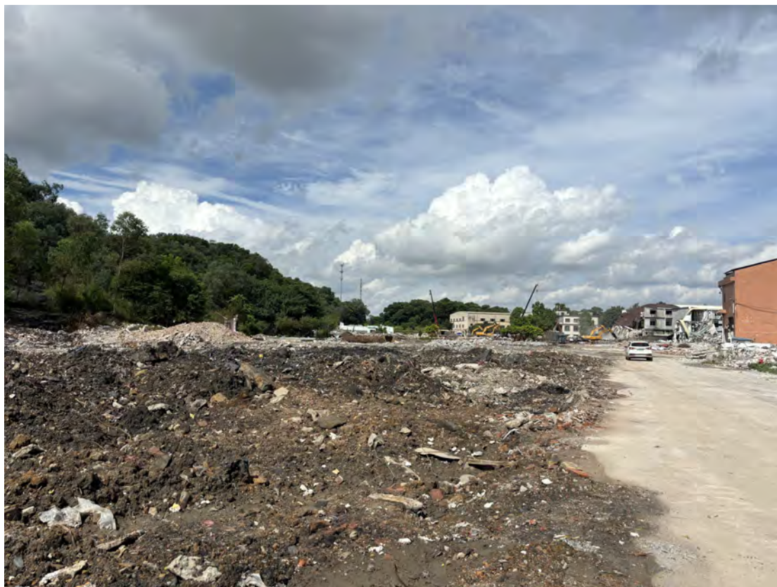
图 24 地块南部现状（东-西）