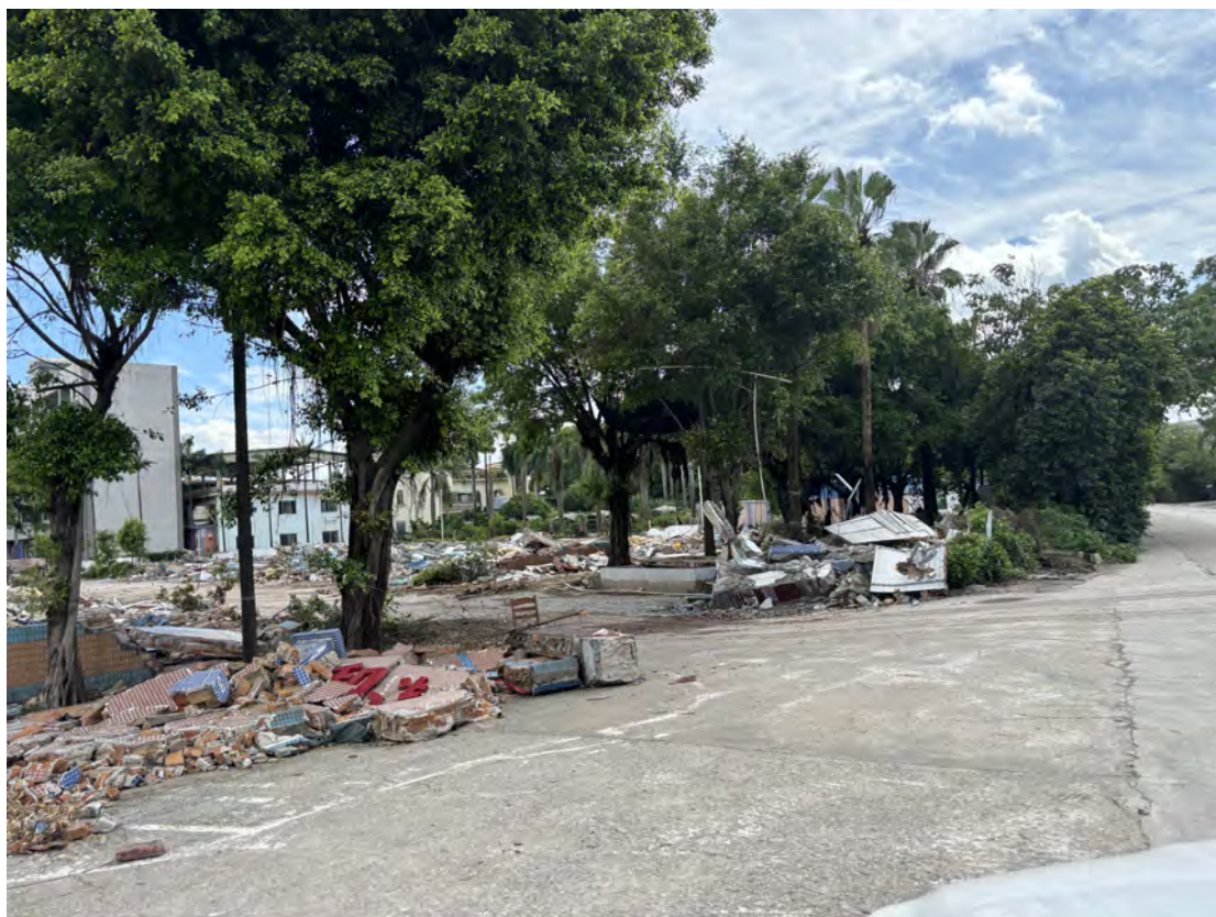
图 33 地块南部现状（西-东）