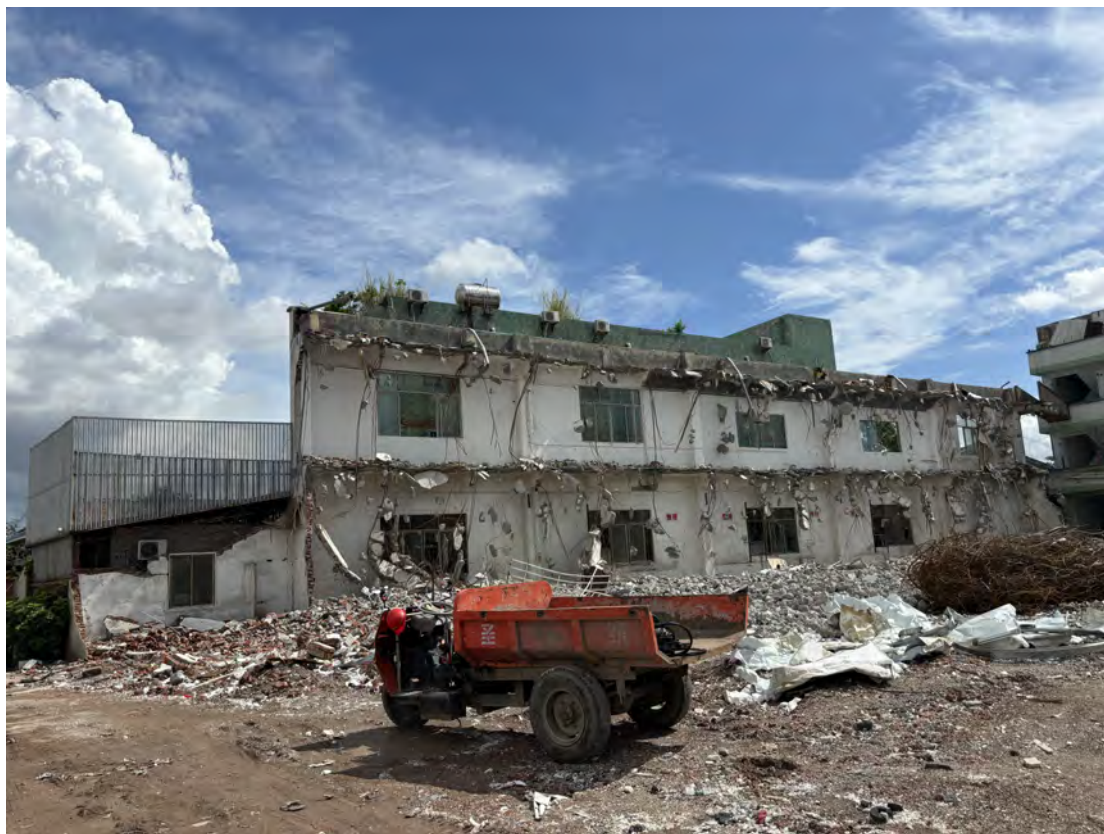
图 28 地块南部现状（南-北）