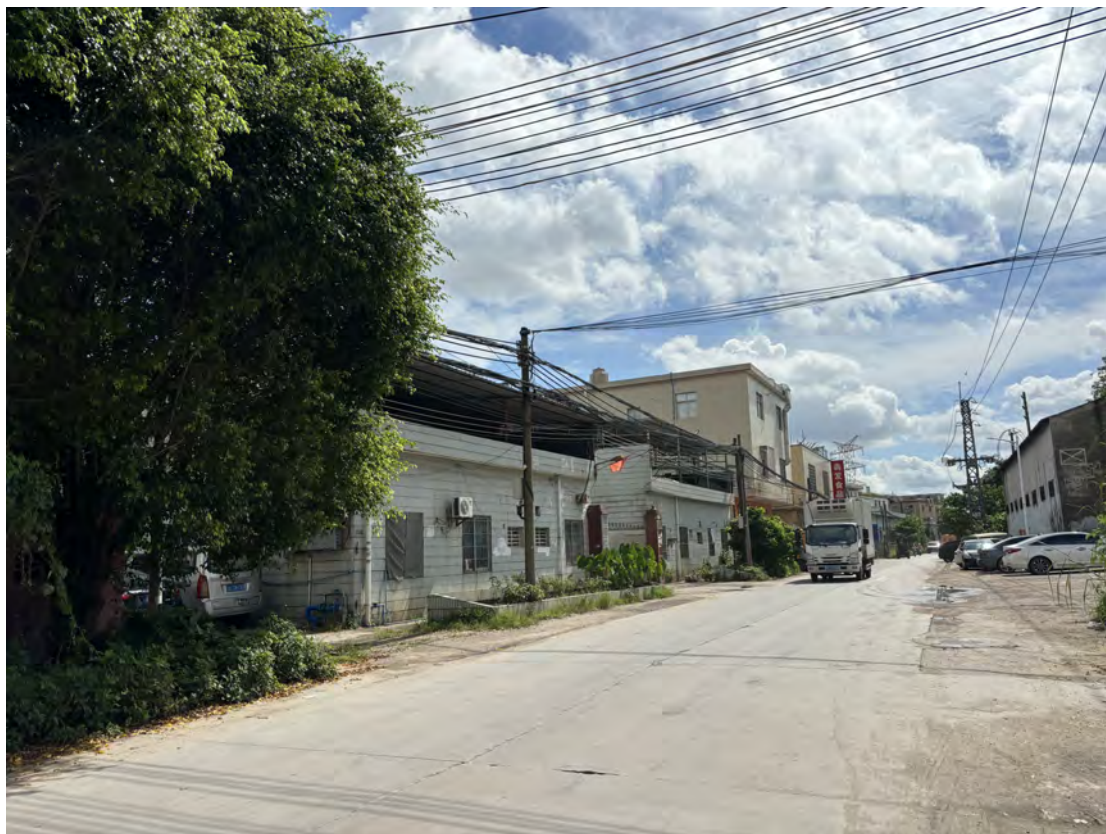
图 14 地块北部现状（西-东）