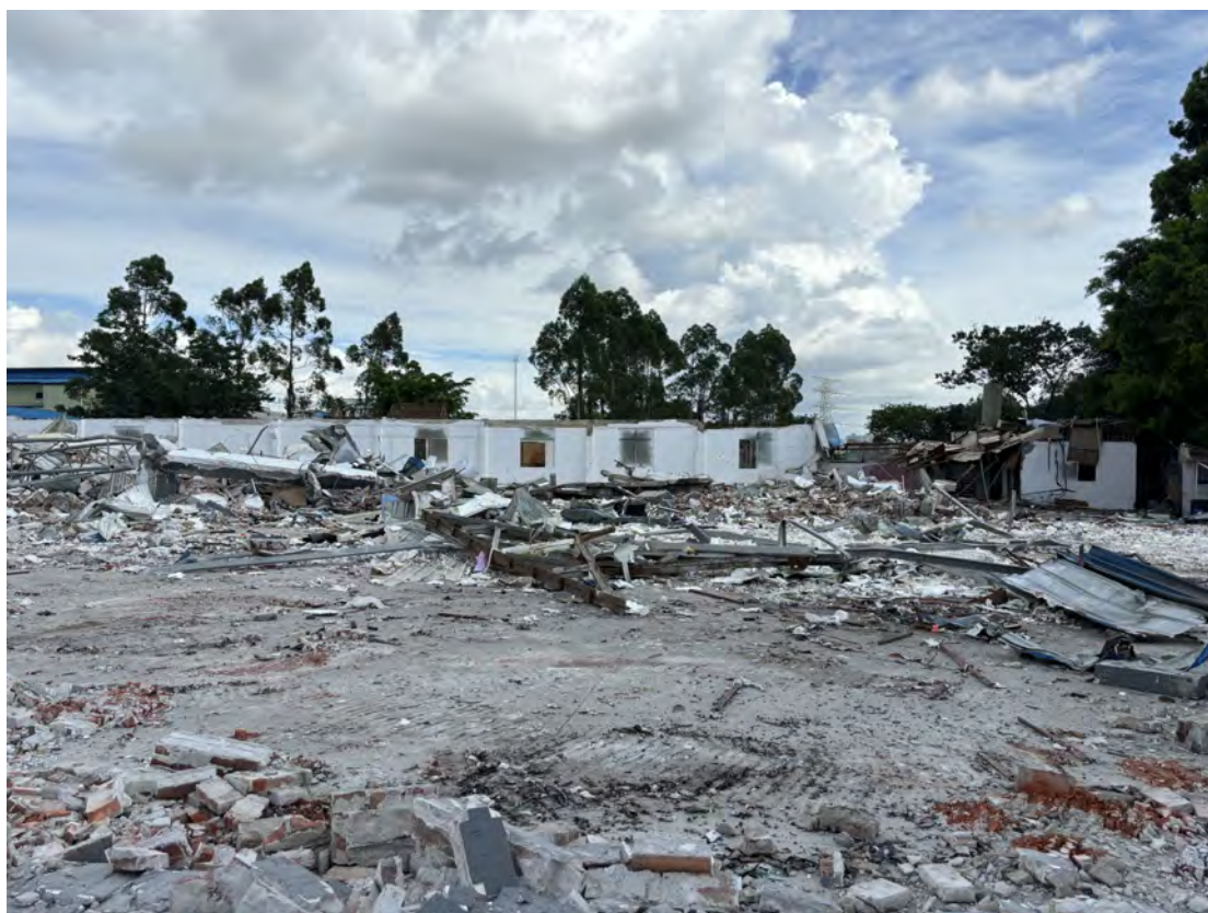
图 40 地块南部现状（南-北）