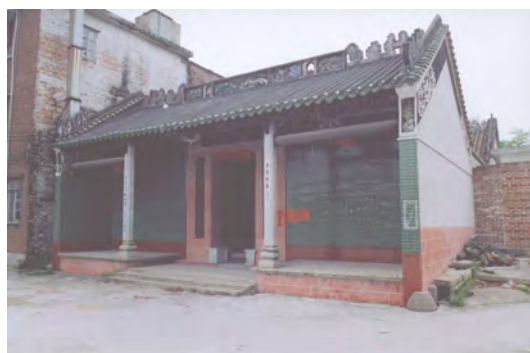
图 10 邝氏宗祠

邝氏宗祠: 位于白云区江高镇大龙头村龙头东街，是该村邝姓族人的太公祠。始建年代不详，重建于清咸丰年间，2002 年重修。硬山顶，人字山墙，灰塑博古脊，碌灰筒瓦，绿色陶瓦当剪边。青砖砌墙，红砂岩墙脚。该祠坐西朝东，三间两进，总面阔 12.3 米，总进深 24.4 米，建筑占地面积 420.66 平方米。祠前有地坪，面积约 500 平方米。坪前是池塘，水面积约 500 平方米。