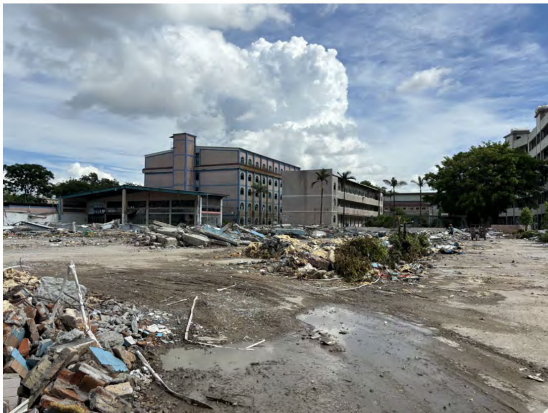
图 36 地块南部现状（南-北）