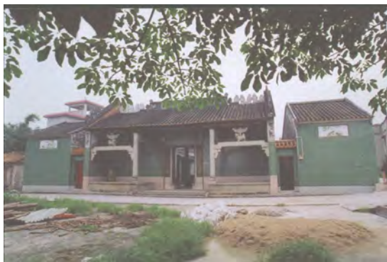
图 6 黄氏大宗祠