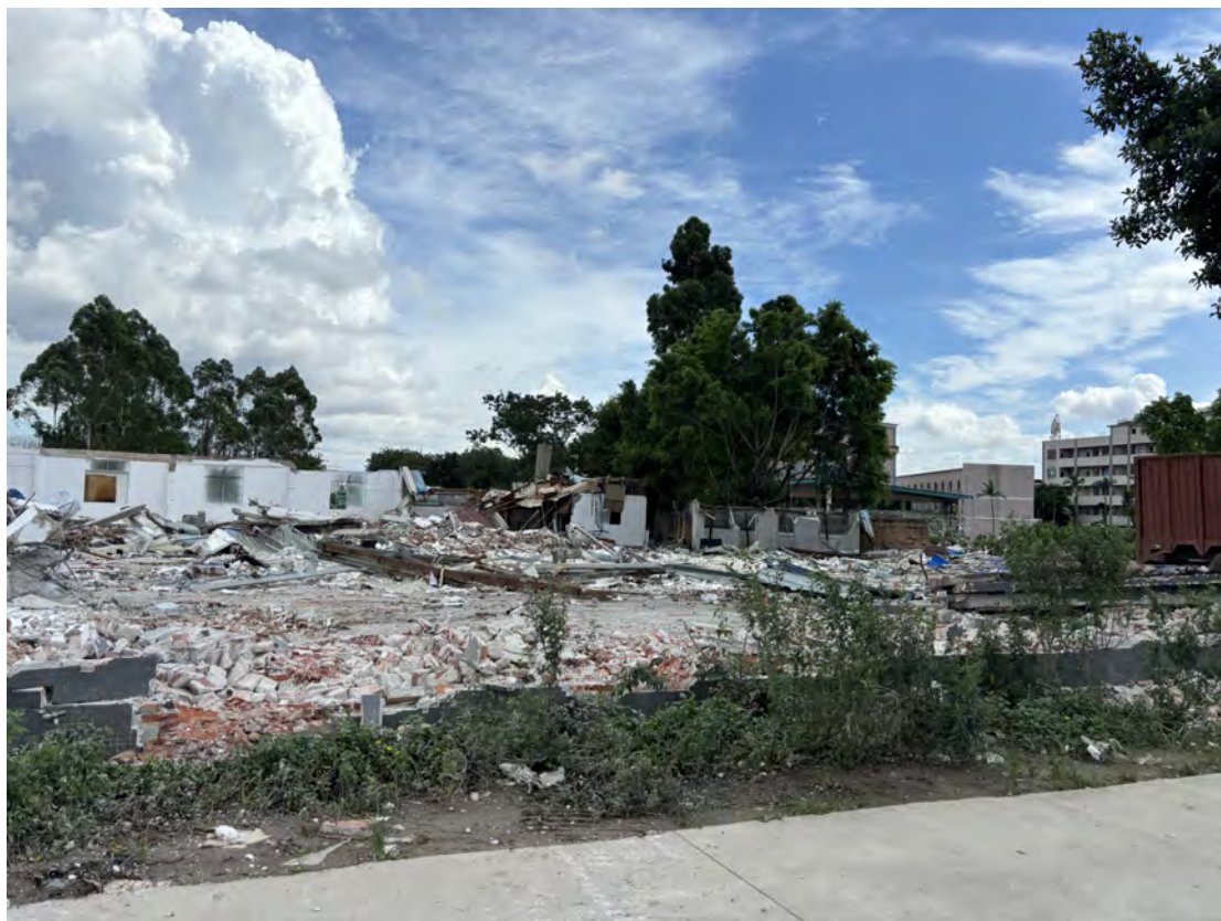
图 32 地块南部现状（西-东）