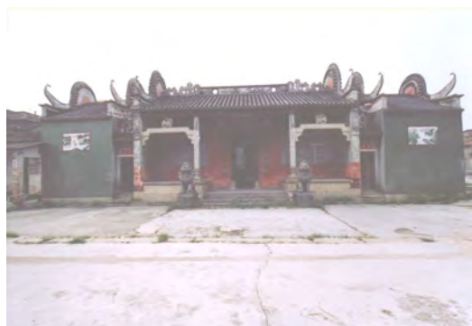
图 8 伍氏大宗祠