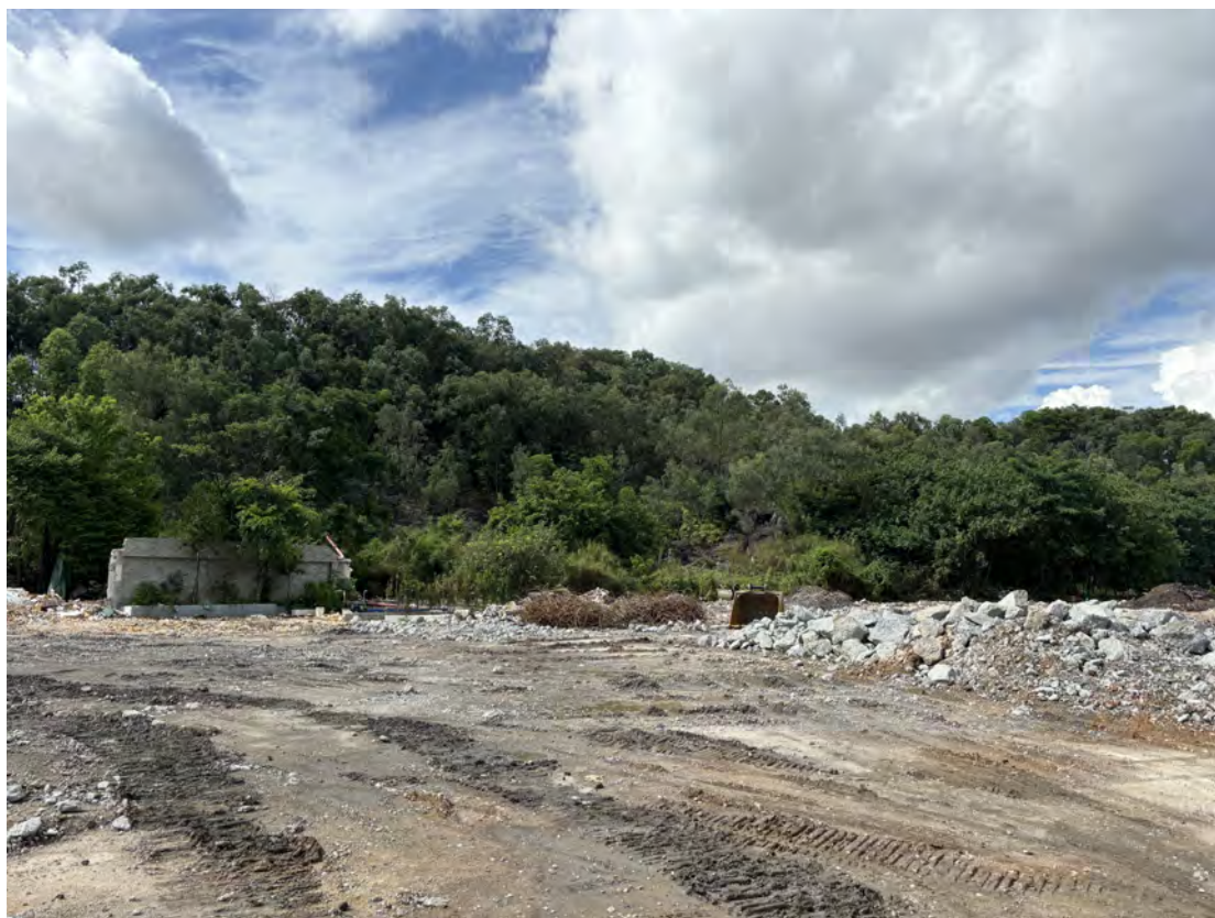
图 25 地块南部现状（北-南）