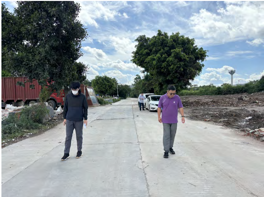
图 13 对地块进行踏查（西-东）