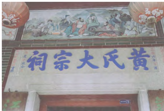
图 7 黄氏大宗祠石门额

伍氏大宗祠： 位于白云区江高镇大龙头村南面，是该村伍氏族人的太公祠。据族谱记载，伍氏先祖廷聚公，于明代洪武年间率众由番禺蚌湖迁至大龙头定居。该祠始建于清光绪元年（1875），1999 年曾全面修葺。该祠坐北朝南，广三路，