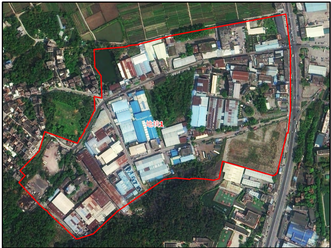
图 5 地块影像图