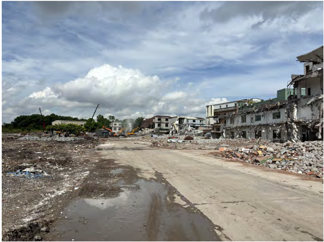
图 26 地块南部现状（东-西）