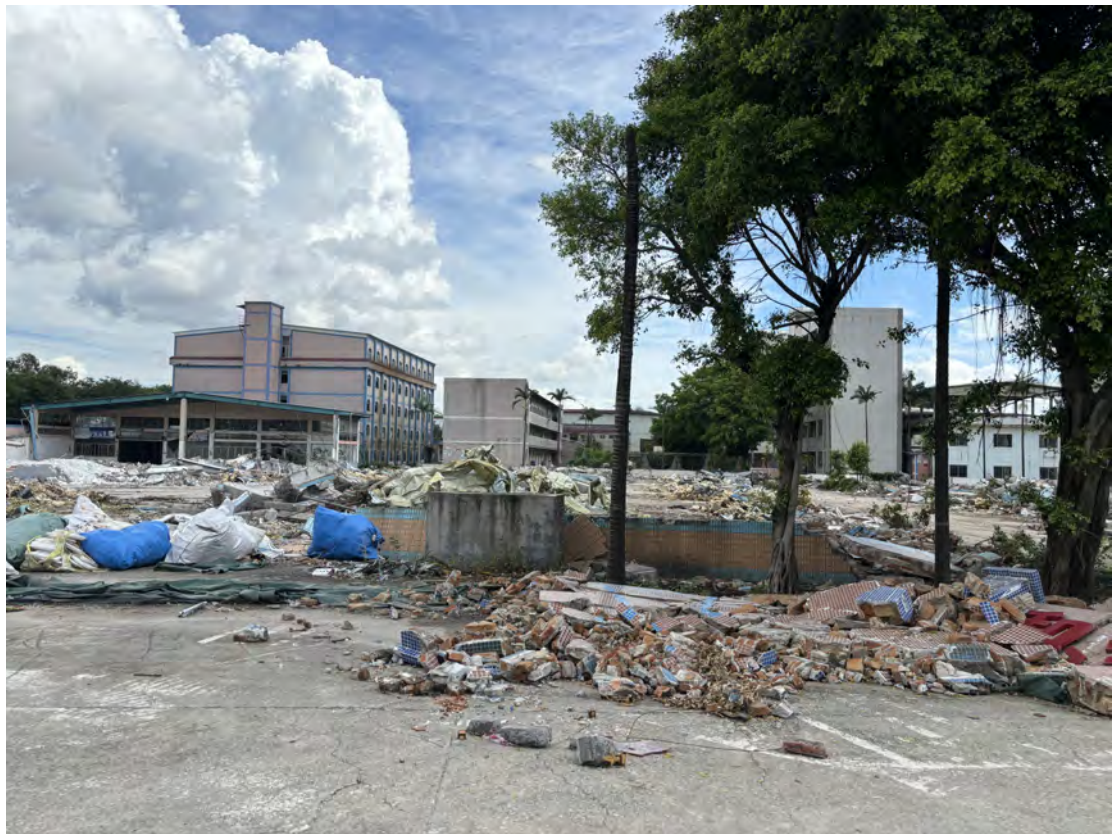
图 34 地块南部现状（南-北）