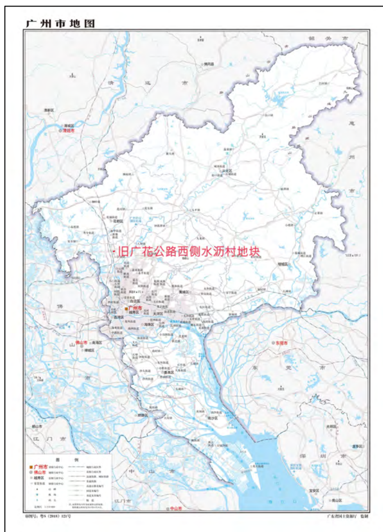
图 1 地块在广州市的位置示意图（广东省国土资源厅）

根据《中华人民共和国文物保护法》《广州市文物保护规定》，按照《广州市文物局关于旧广花公路西侧水沥村地块考古调查勘探工作的复函》（文物20240693号）指导意见，受广州市白云区土地开发中心委托，由我院配合该地块收储出让，对该地块进行考古调查工作。