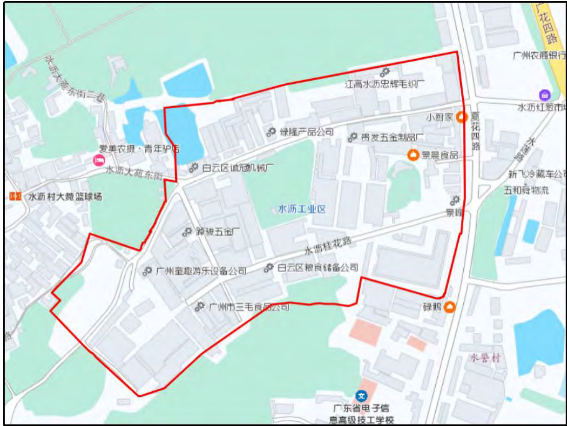
图 4 地块红线范围图