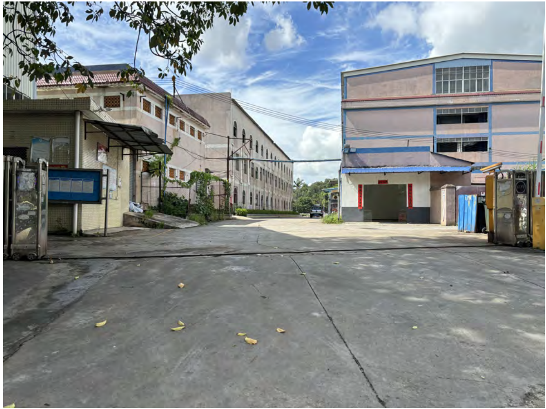
图 20 地块北部现状（北-南）