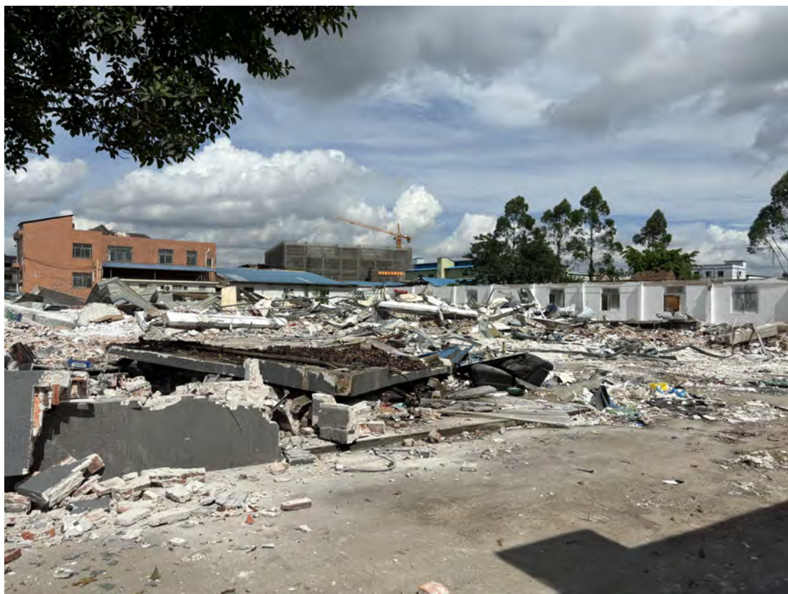
图 39 地块南部现状（东-西）