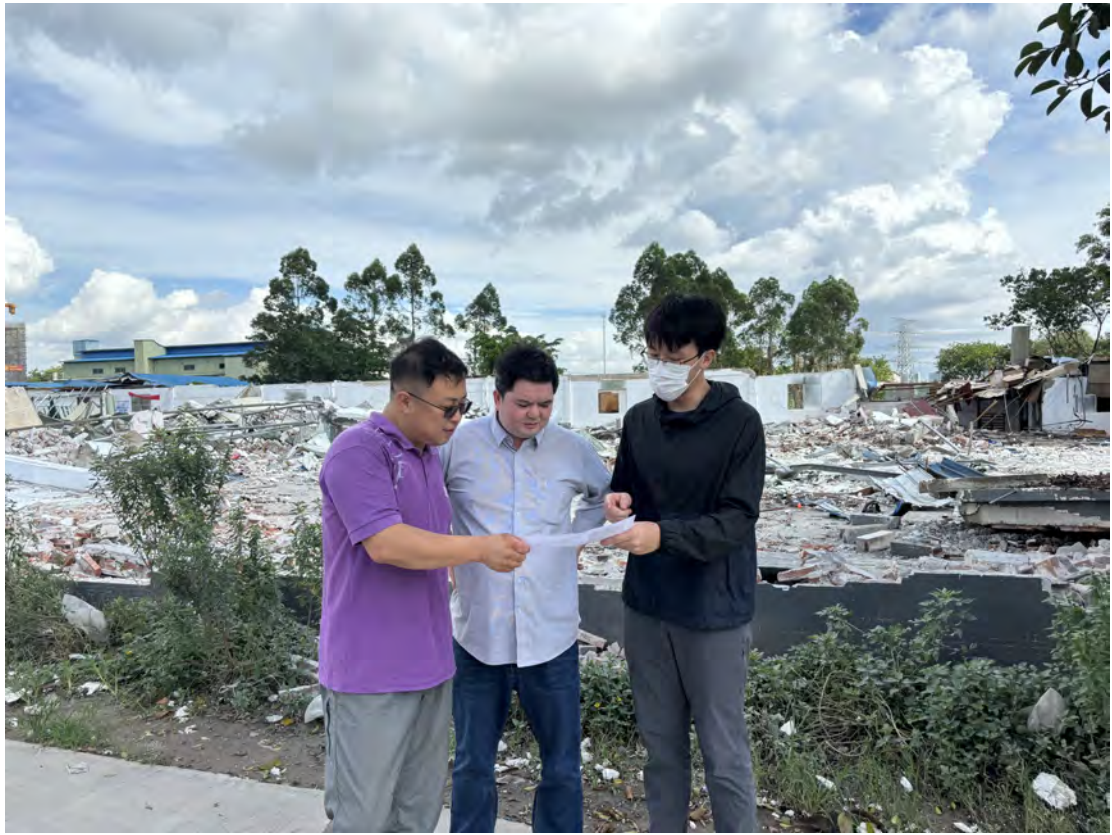
图 12 工作人员现场确定地块范围（南-北）