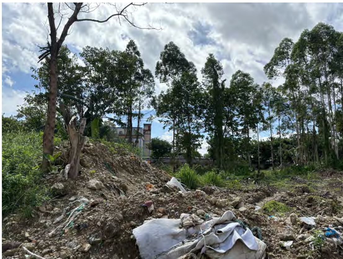
图 15 地块北部现状（北-南）