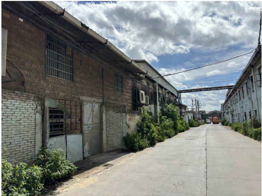
图 21 地块北部现状（西-东）