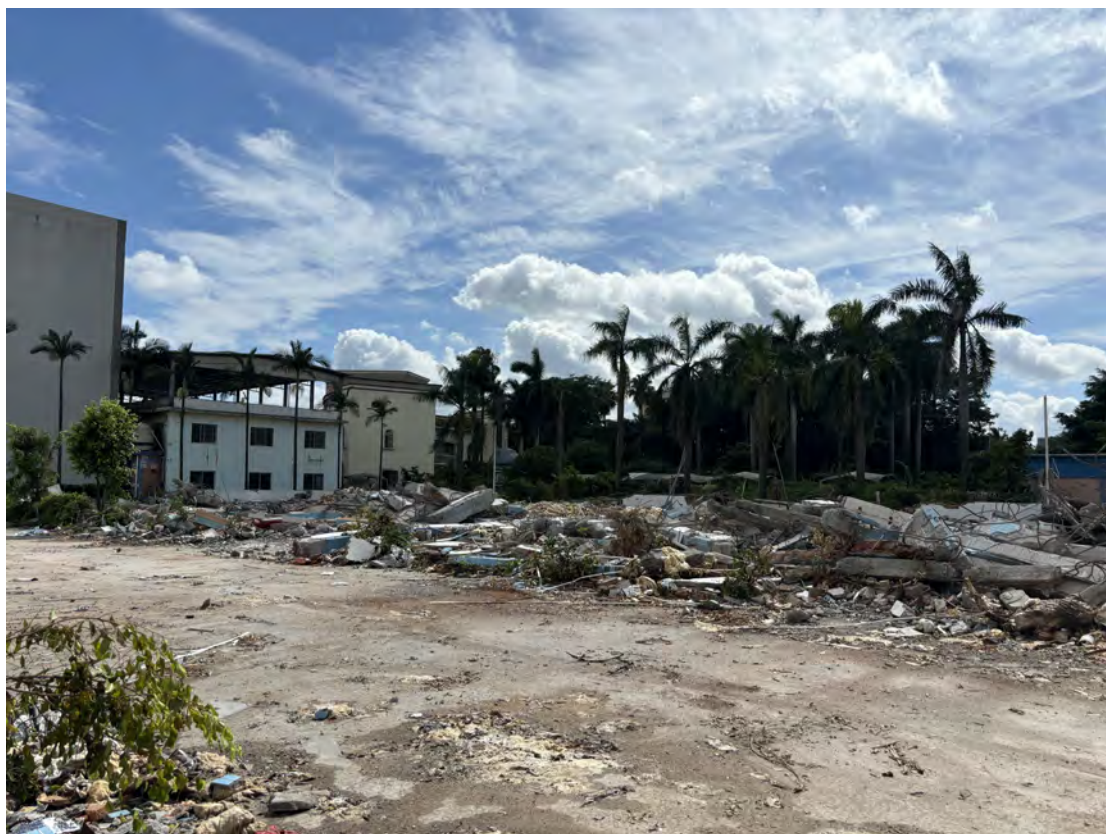
图 37 地块南部现状（南-北）