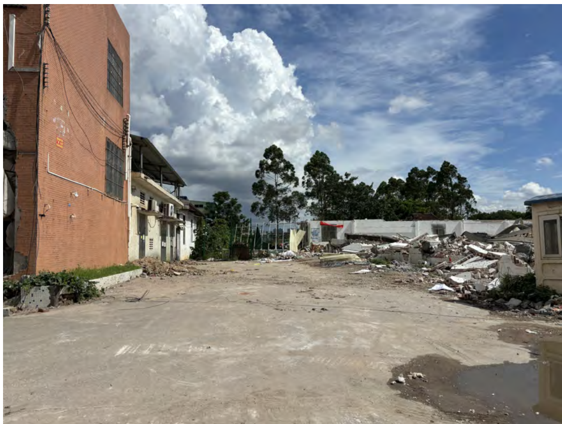
图 31 地块南部现状（南-北）