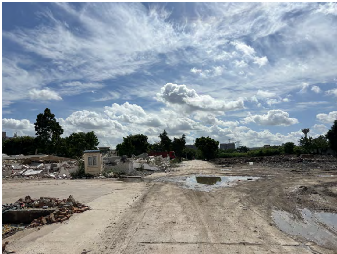
图 30 地块南部现状（西-东）