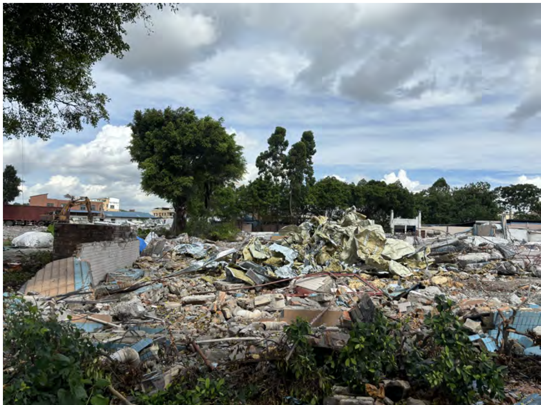
图 35 地块南部现状（东-西）