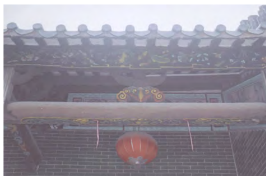
图 11 邝氏宗祠联系枋

头门面阔三间 12.3 米，进深二间 7.7 米共十三架，前廊三步梁。红砂岩门夹石，石门额阴刻楷书“邝氏宗祠”，未具年款、落款。檐柱与山墙之间架坤甸木枋，上施木驼峰、斗拱封檐板保存完好。2002 年重修时。门墙、山墙改贴绿