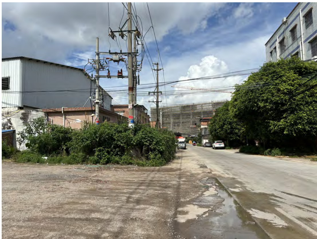
图 17 地块北部现状（东-西）