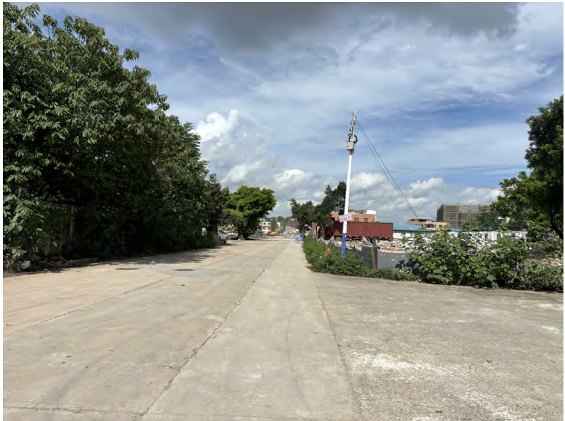
图 23 地块南部现状（东-西）