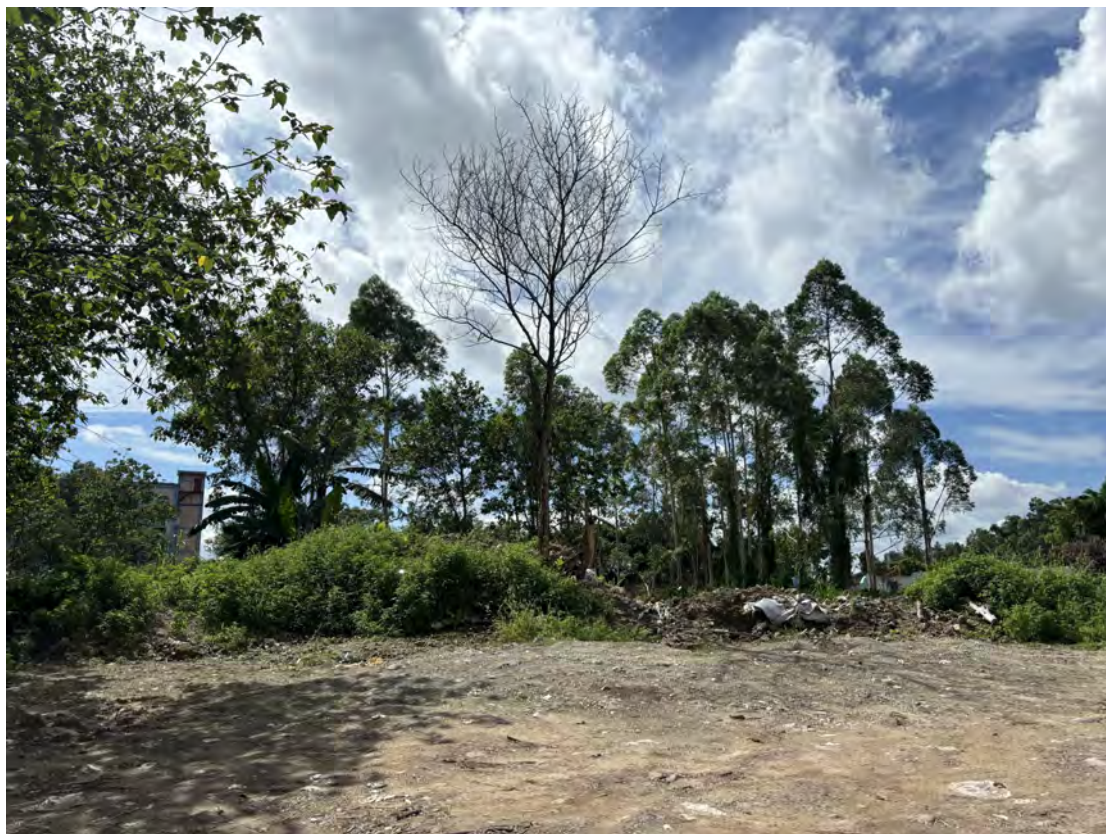
图 16 地块北部现状（北-南）