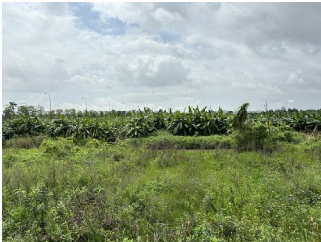
图 32 地块地表现状（西-东）