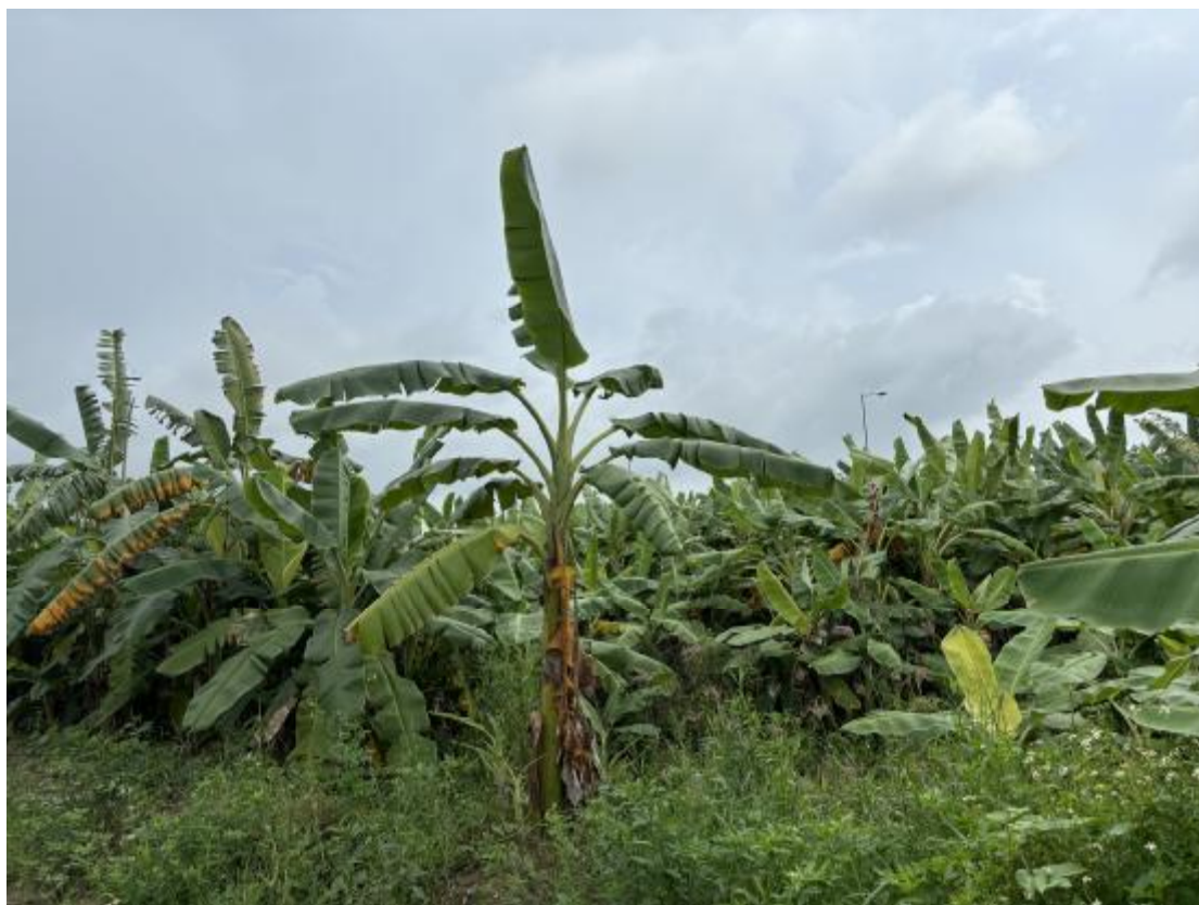
图 25 地块地表现状（南-北）