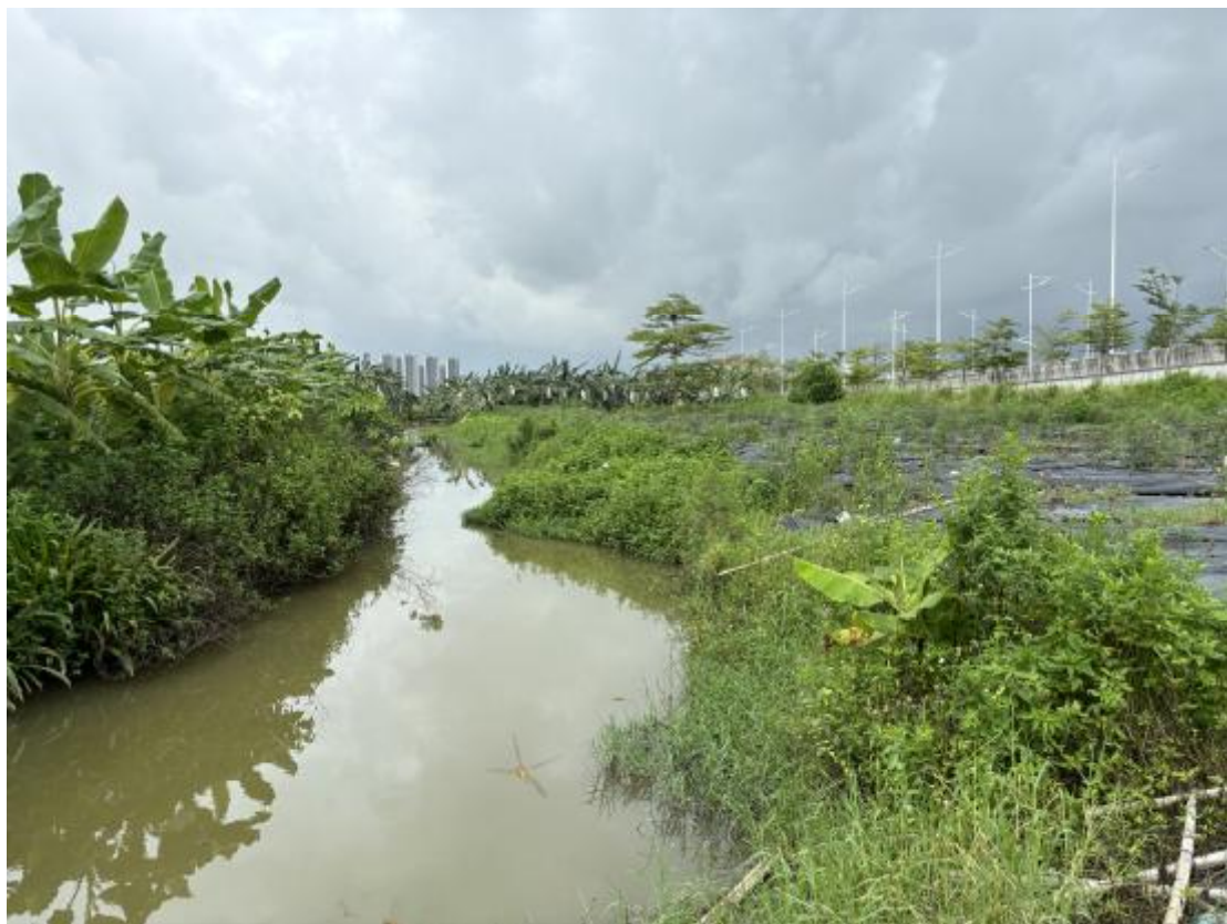
图 28 地块地表现状（北-南）