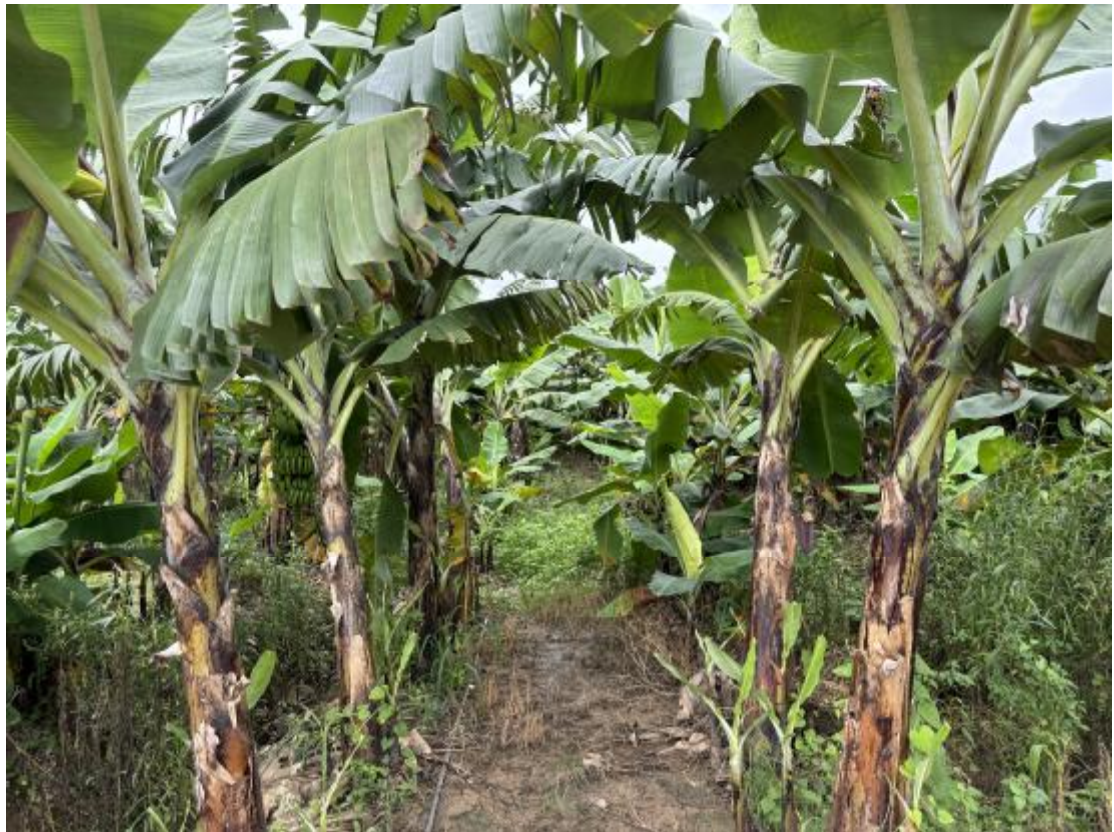
图 17 地块地表现状（北-南）