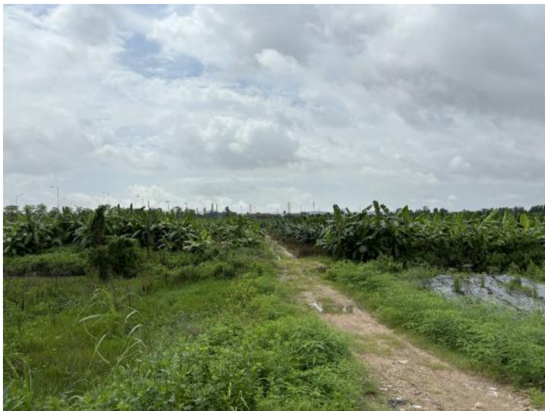
图 31 地块地表现状（西-东）