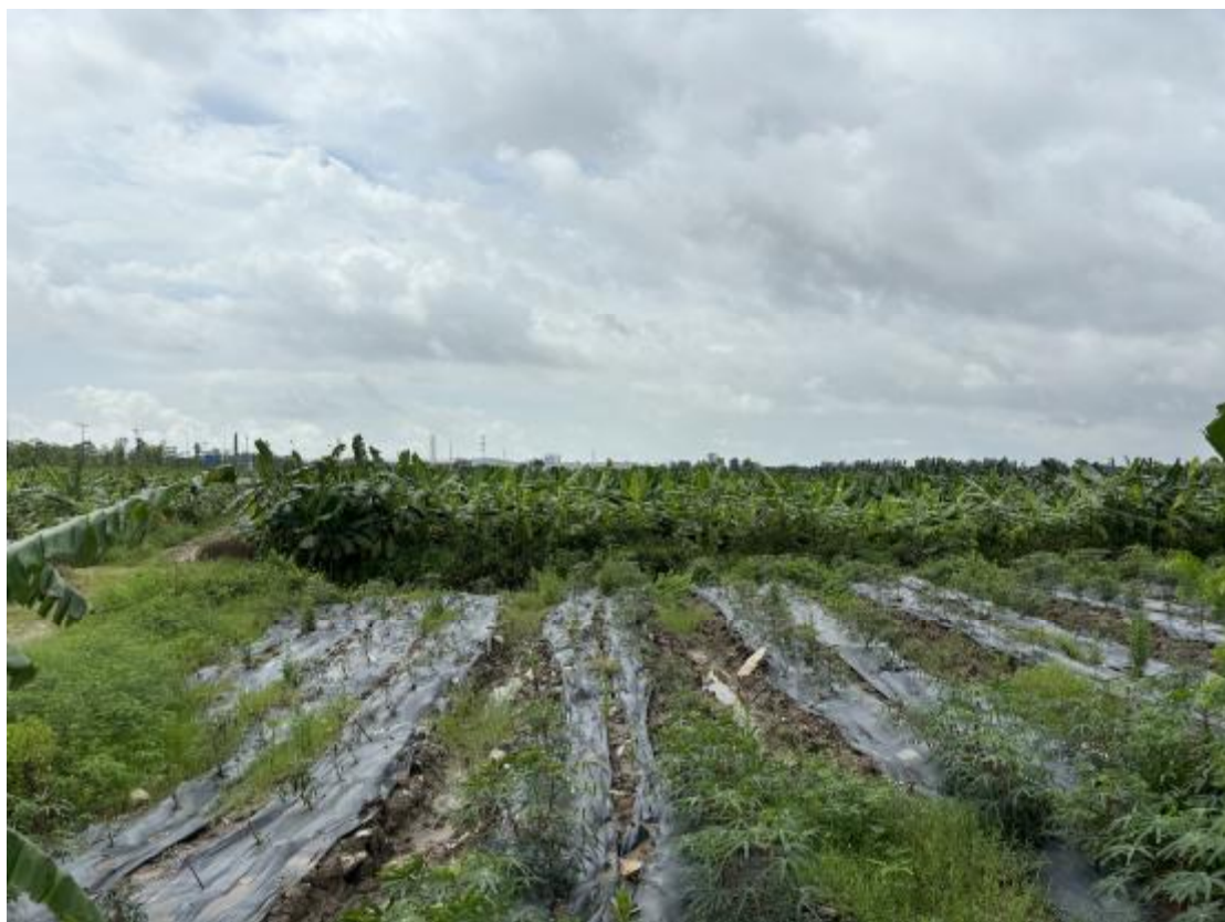
图 29 地块地表现状（西-东）