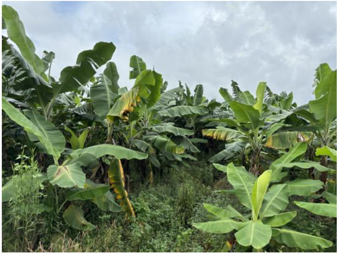
图 14 地块地表现状（北-南）