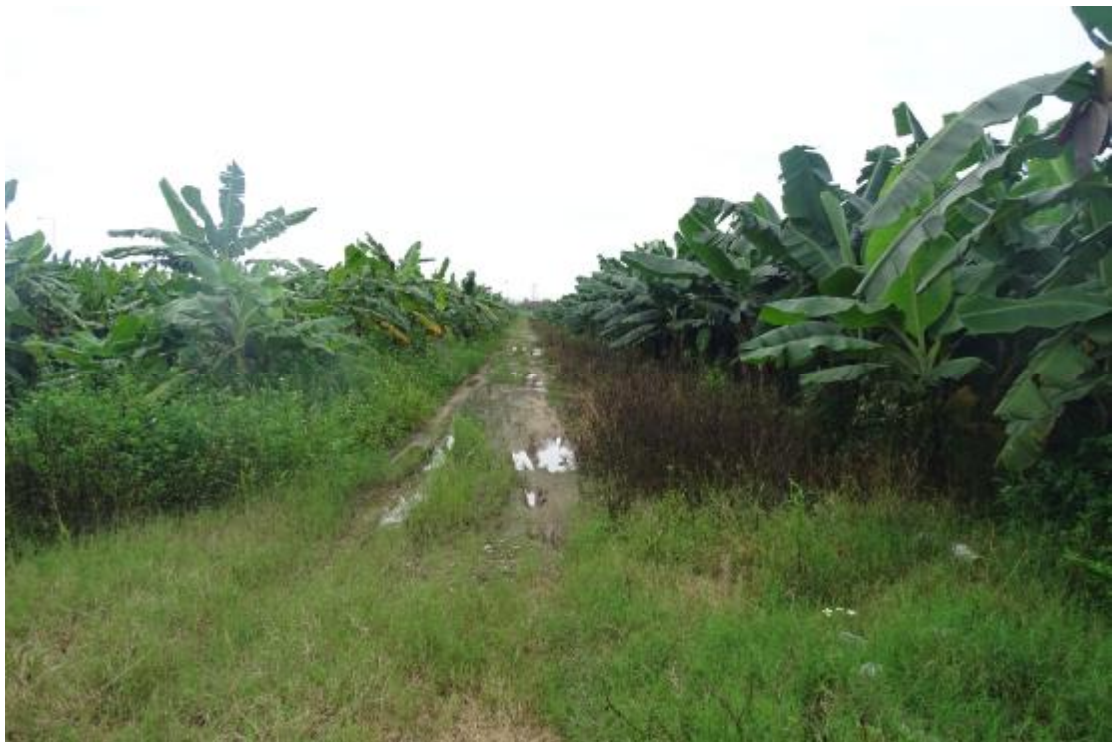
图 11 地块地表现状（西-东）