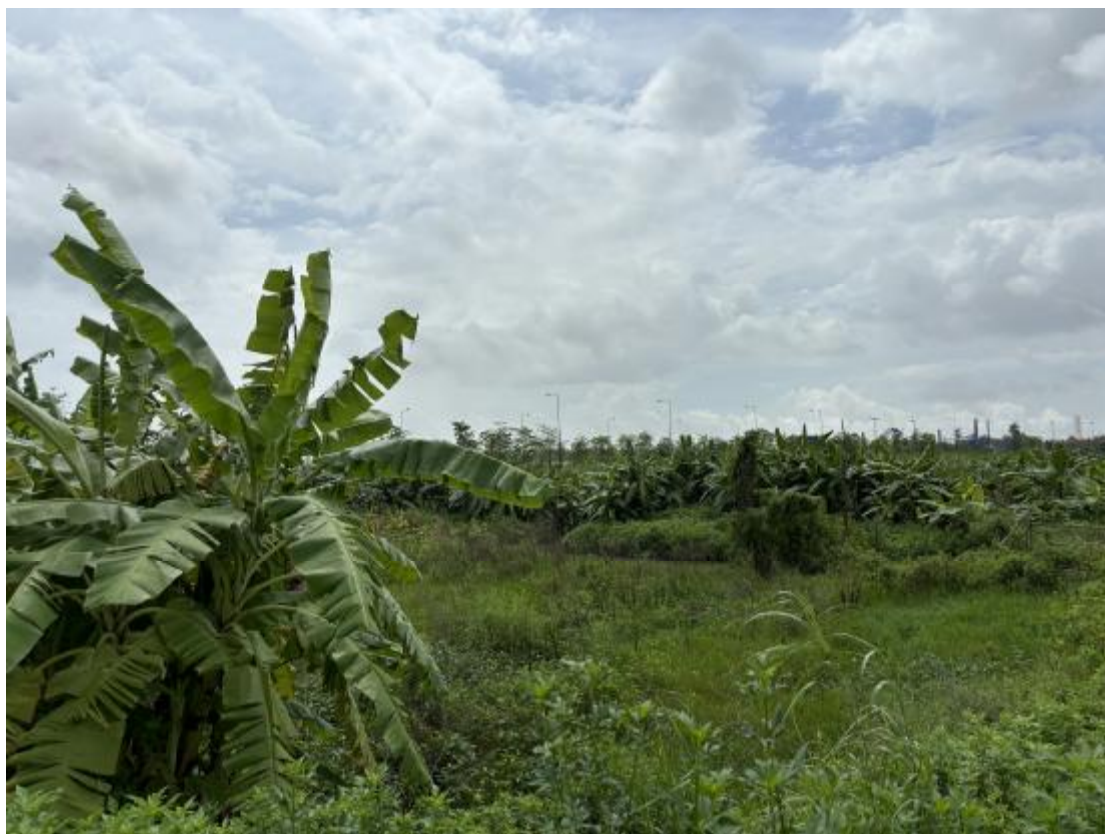
图 33 地块地表现状（西-东）