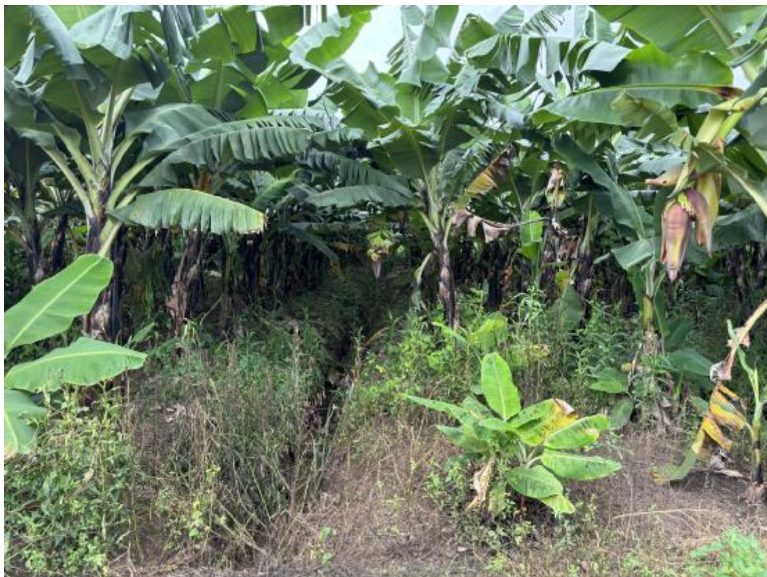
图 26 地块地表现状（北-南）