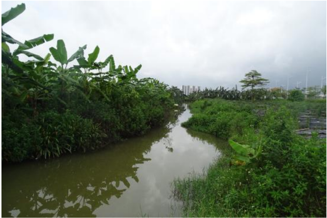
图 10 地块地表现状（北-南）