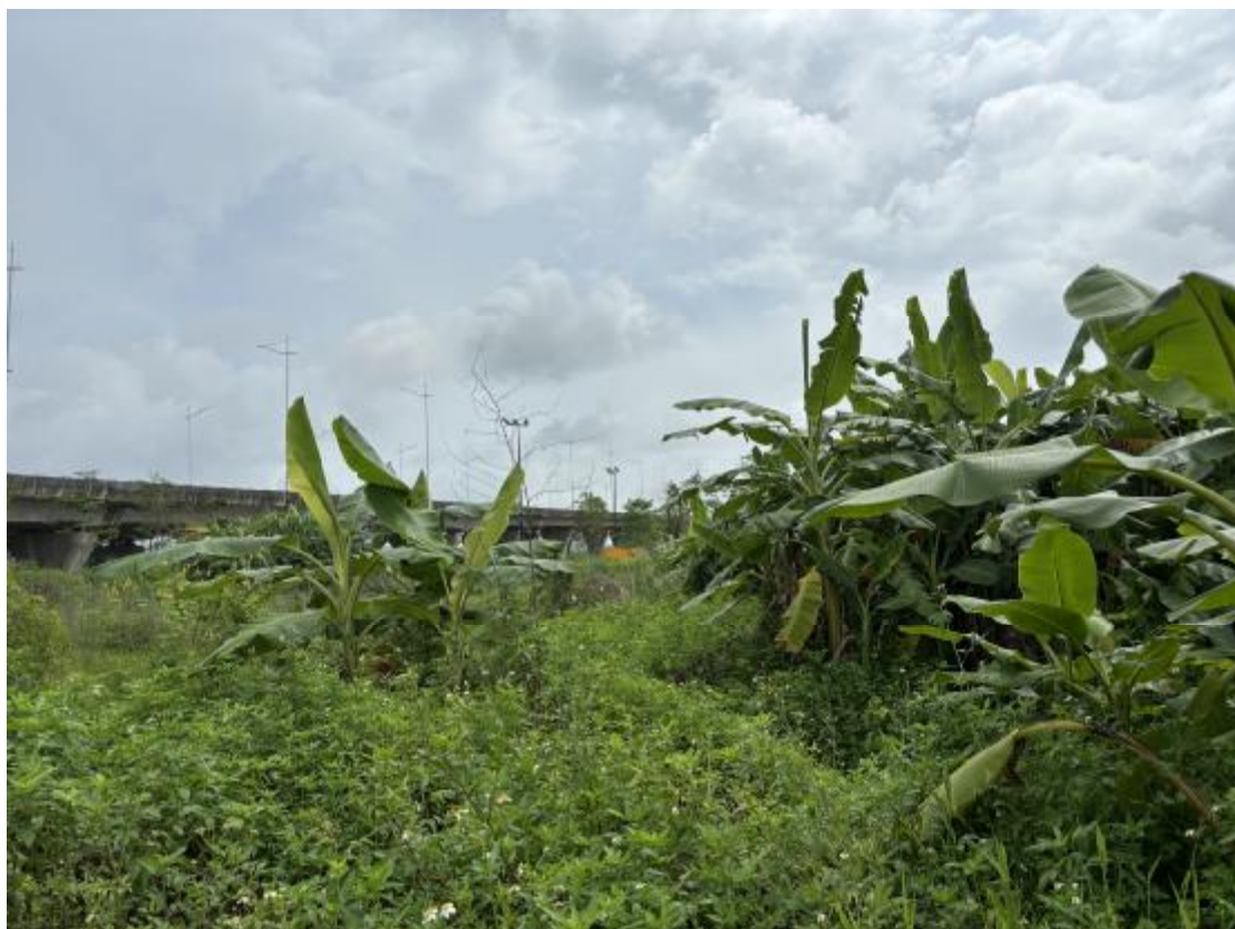
图 27 地块地表现状（东-西）