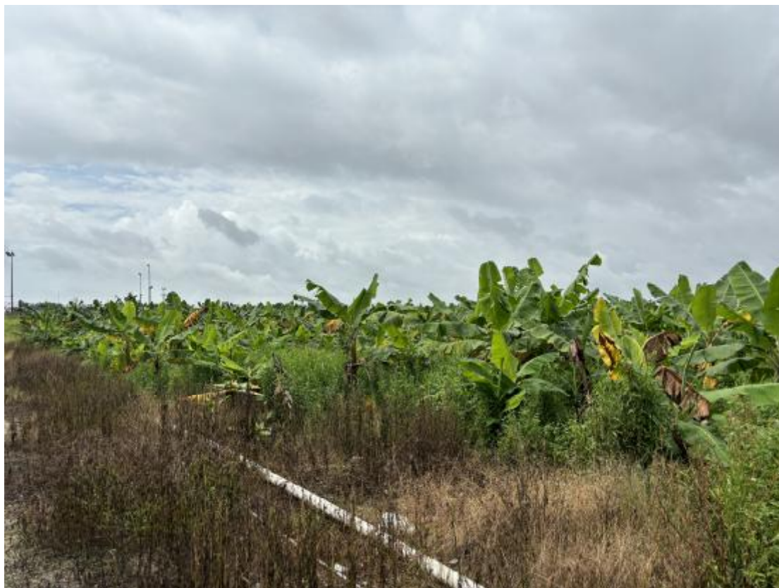
图 18 地块地表现状（西-东）