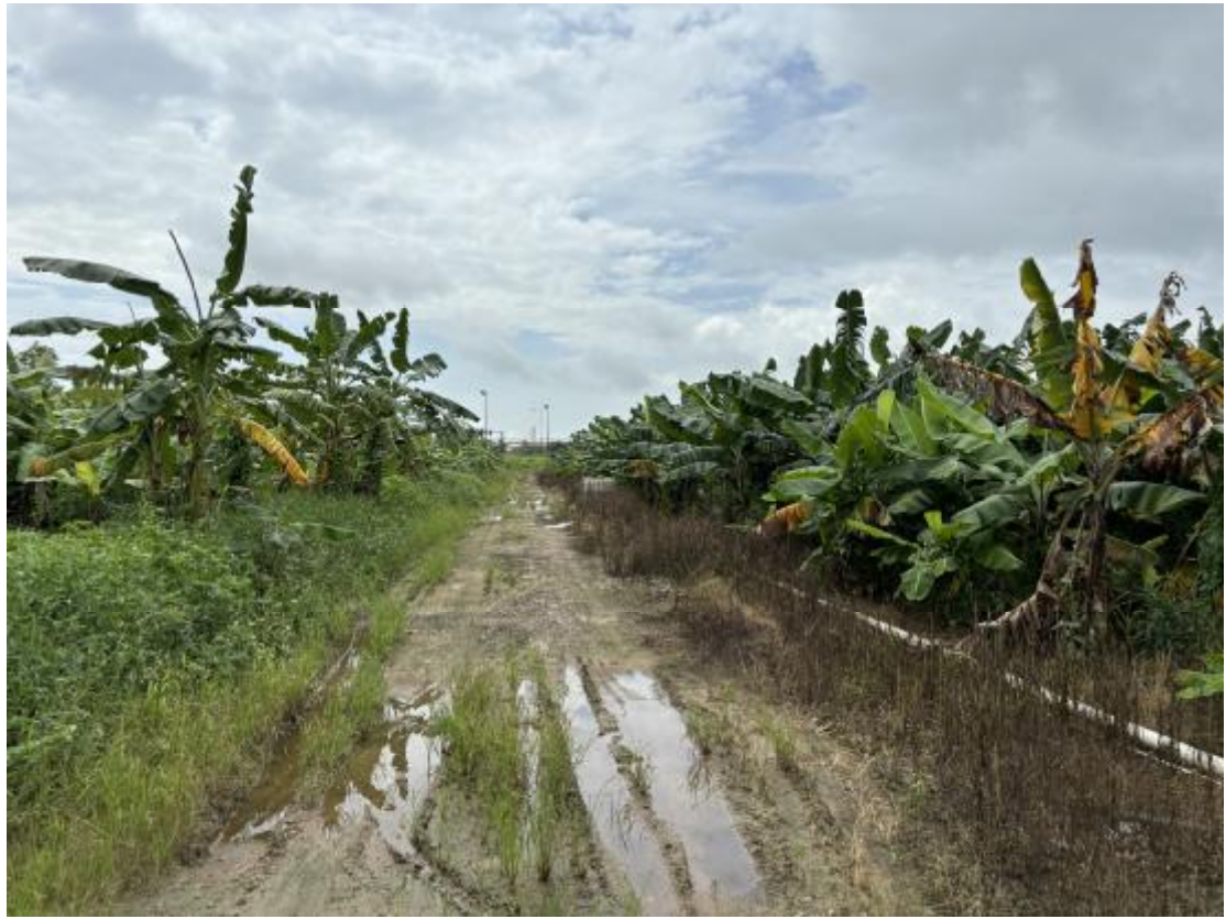
图 16 地块南部地表现状（西-东）