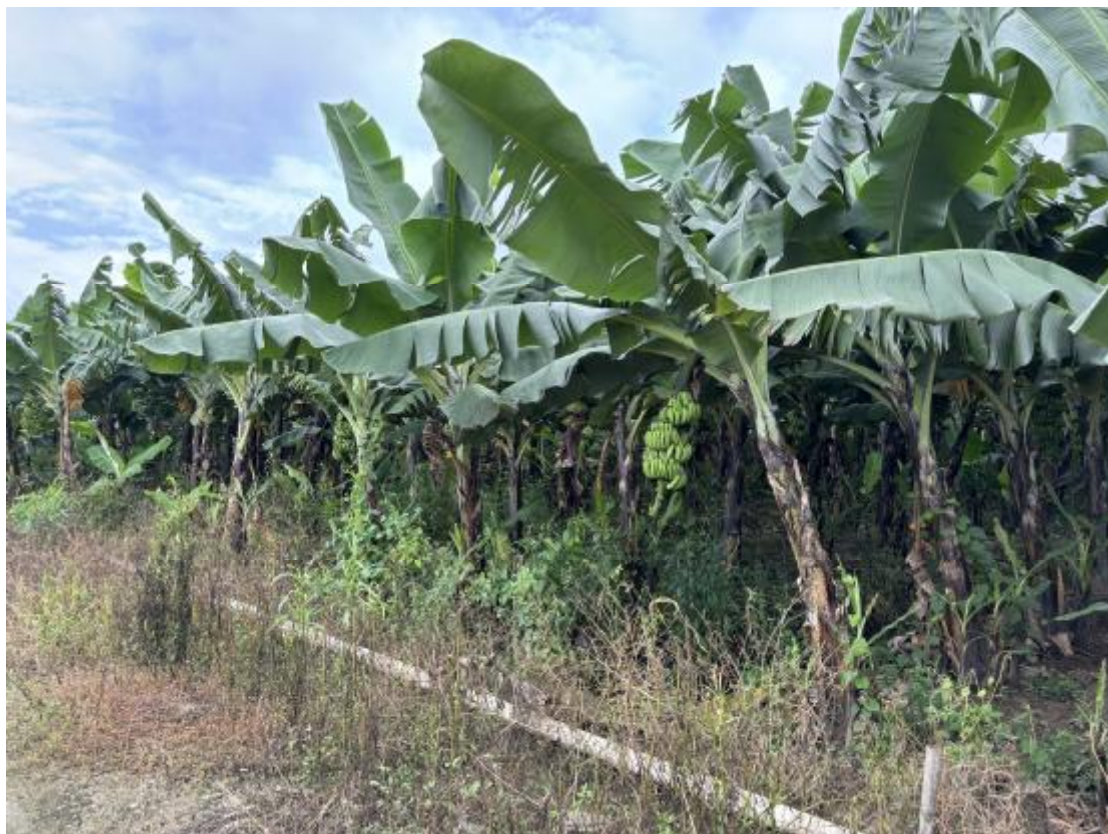
图 12 地块地表现状（西-东）