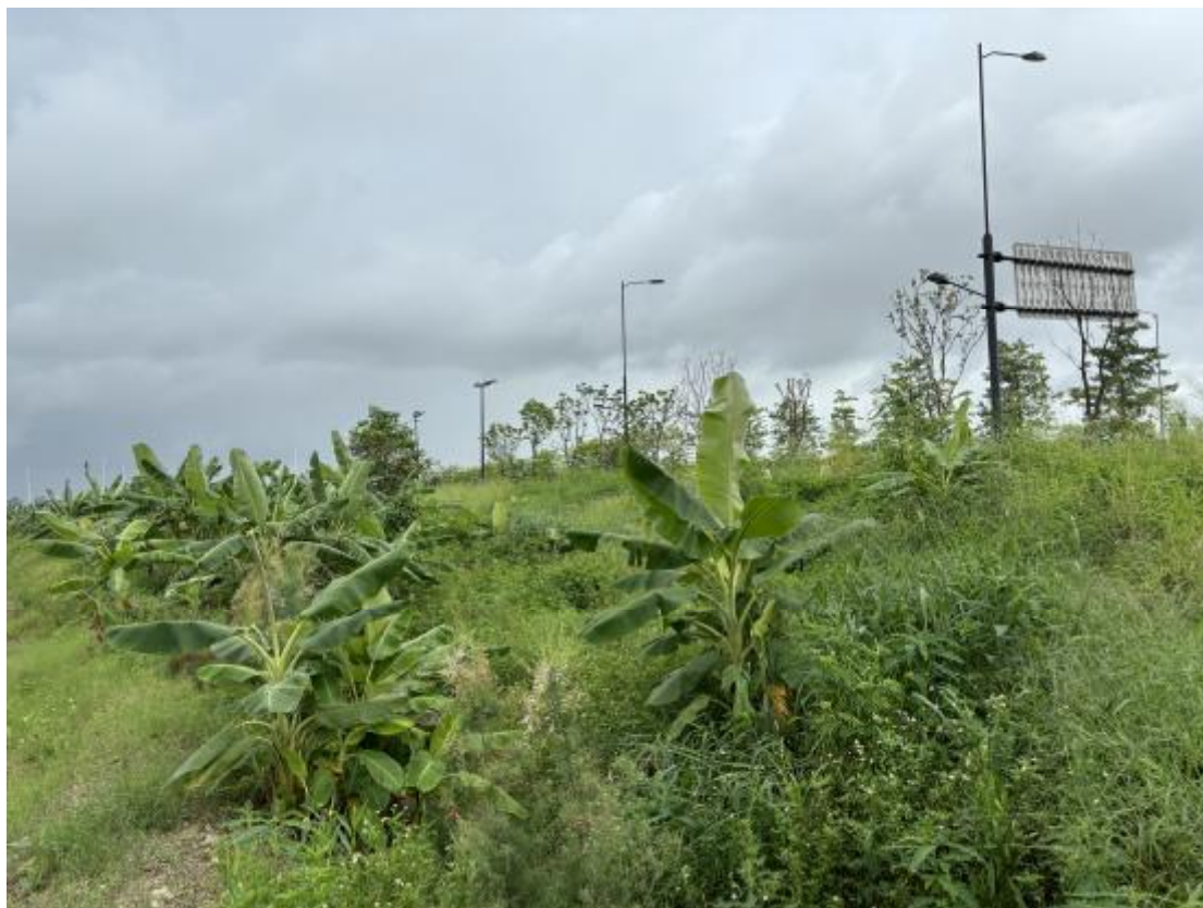
图 20 地块地表现状（东-西）