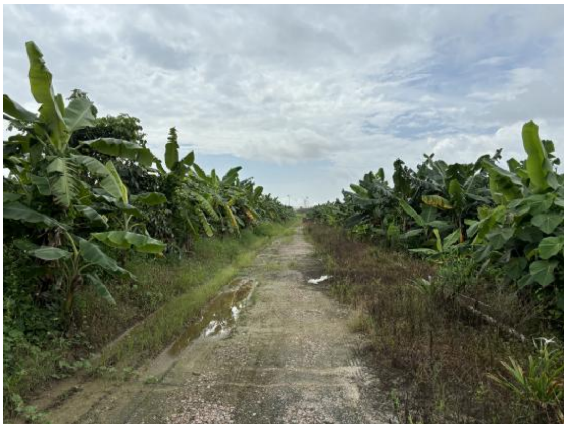
图 13 地块地表现状（西-东）