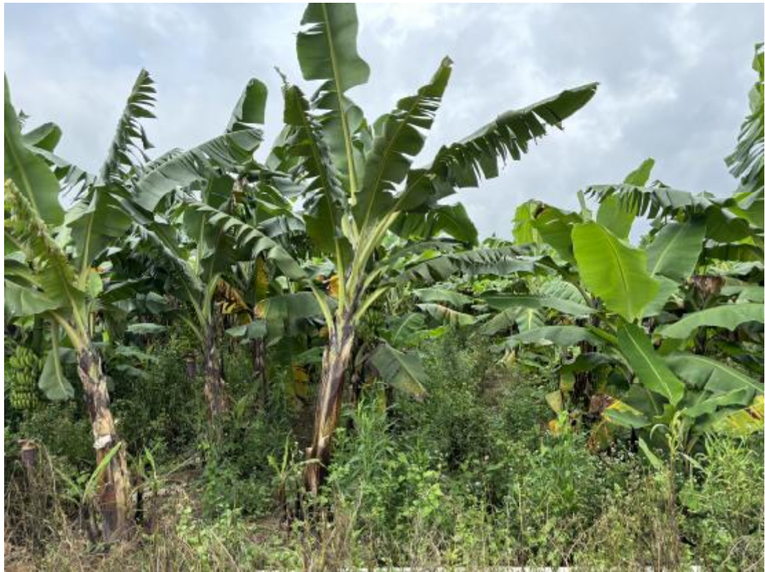
图 15 地块地表现状（北-南）