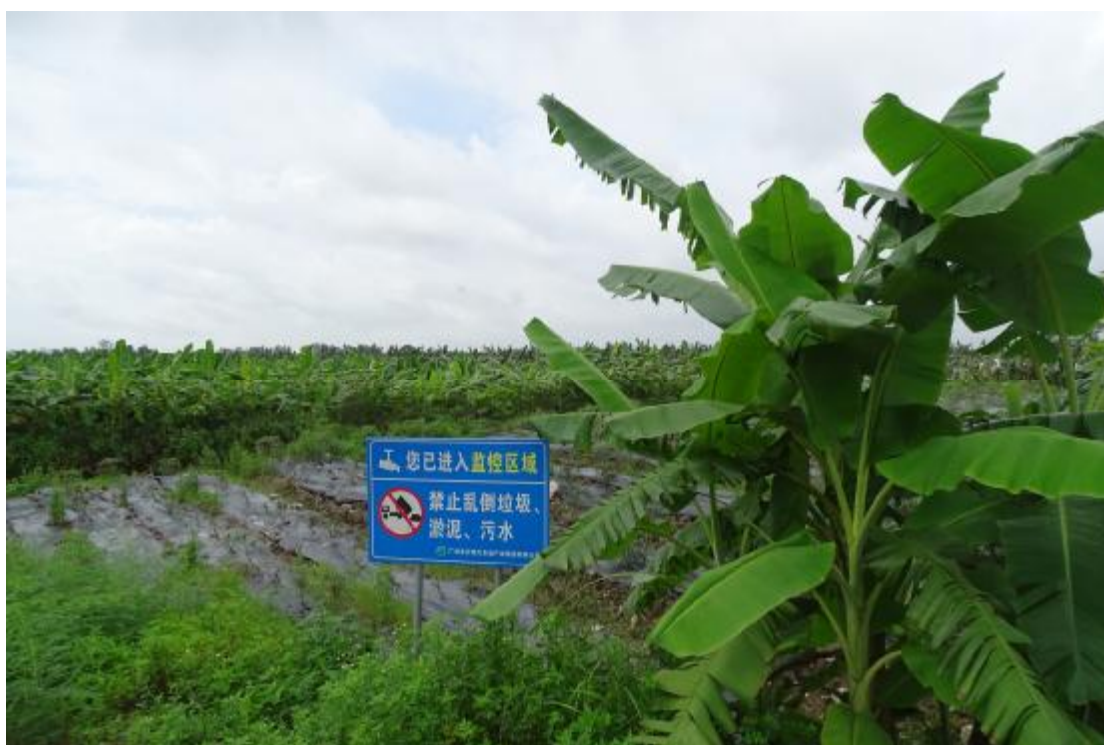
图 8 地块地表现状（西-东）