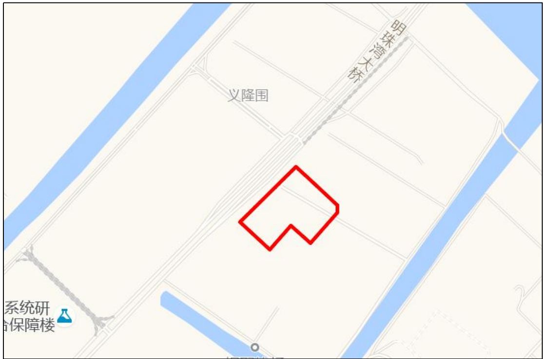
图 4 地块周边环境示意图（高德地图）