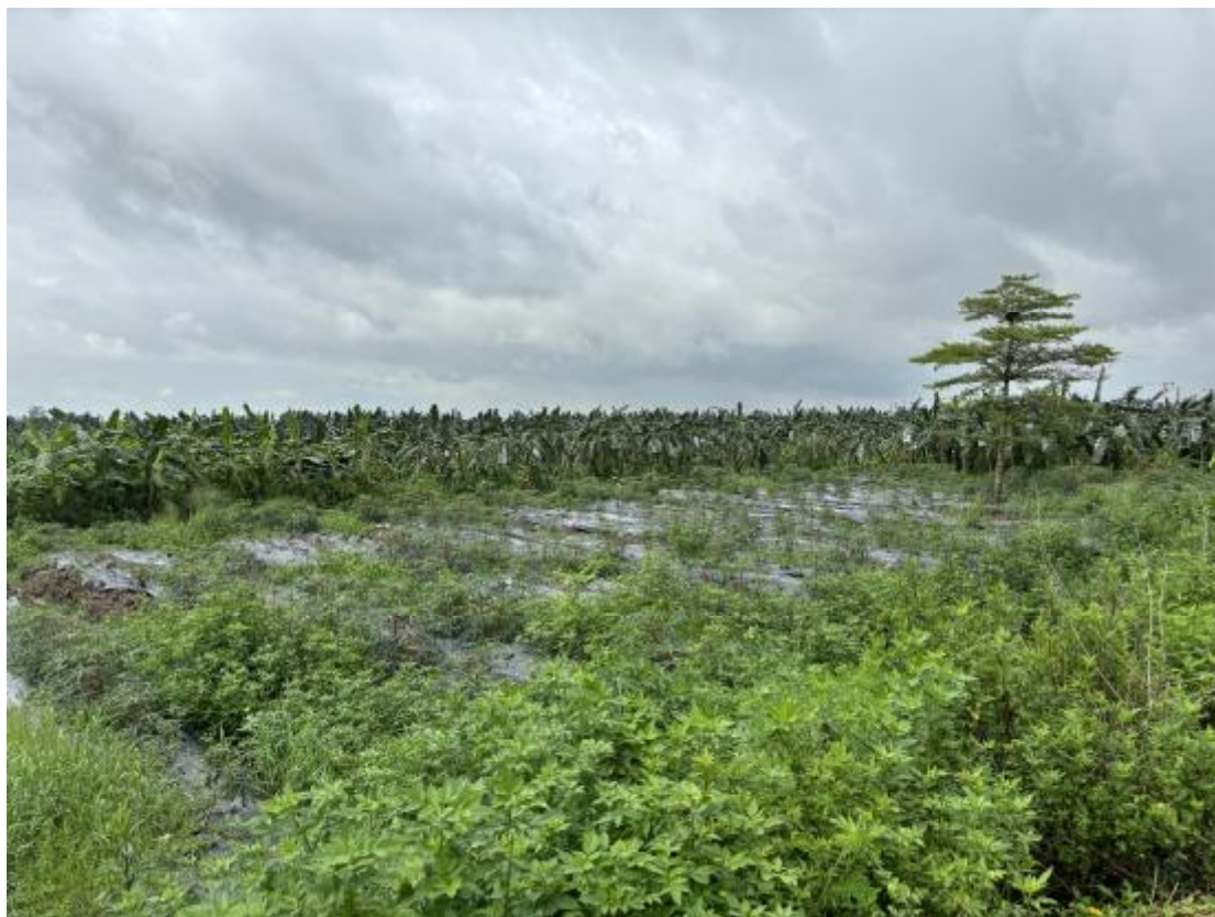
图 30 地块地表现状（西-东）