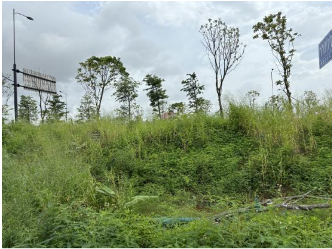
图 22 地块地表现状（南-北）