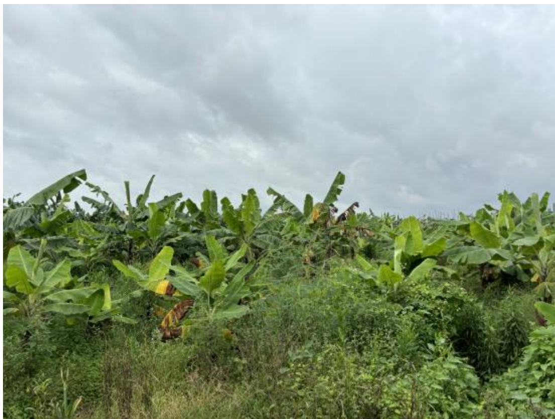
图 19 地块地表现状（北-南）