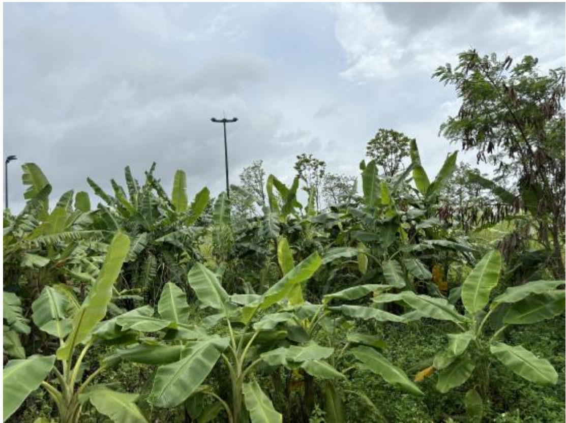
图 23 地块地表现状（南-北）