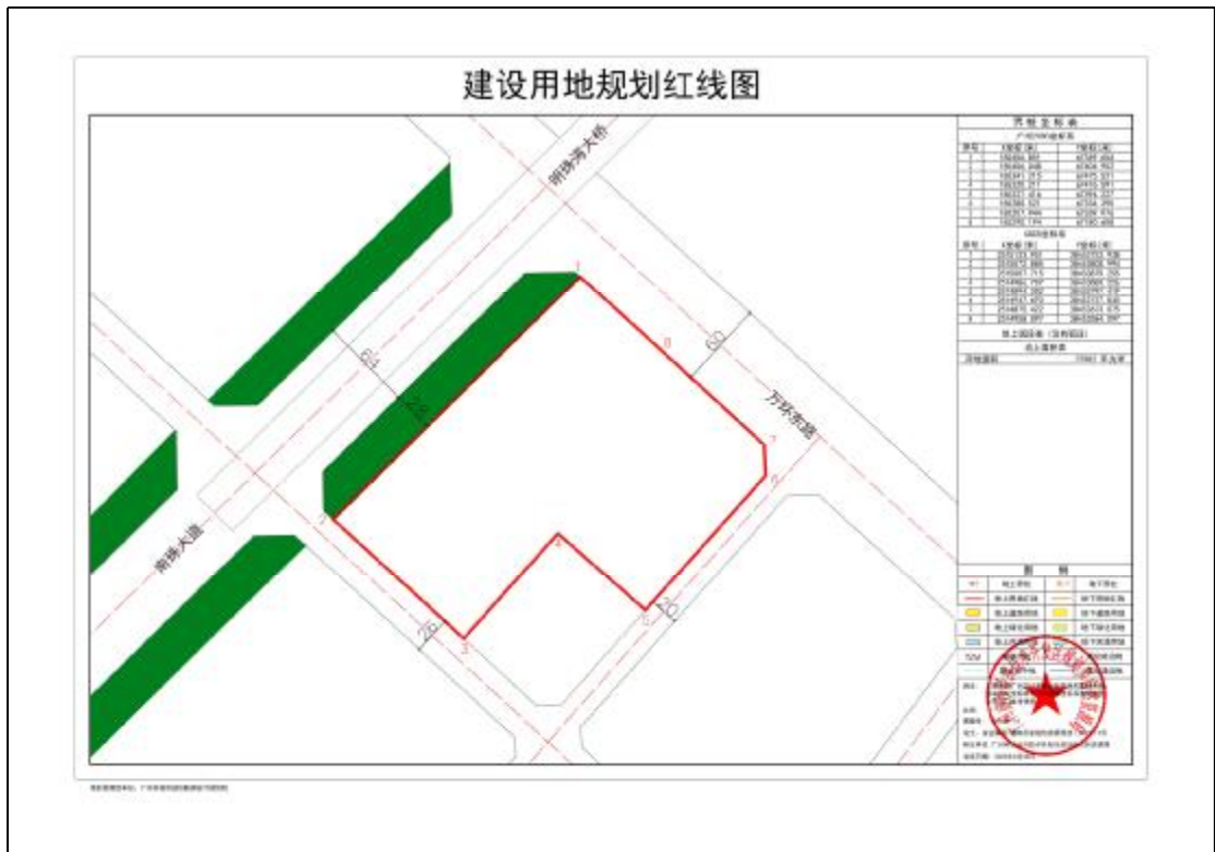
图 5 地块用地规划红线图