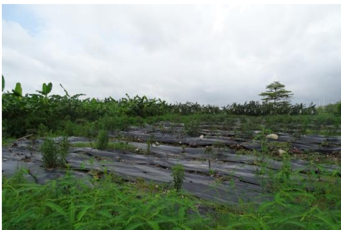
图 9 地块地表现状（北-南）