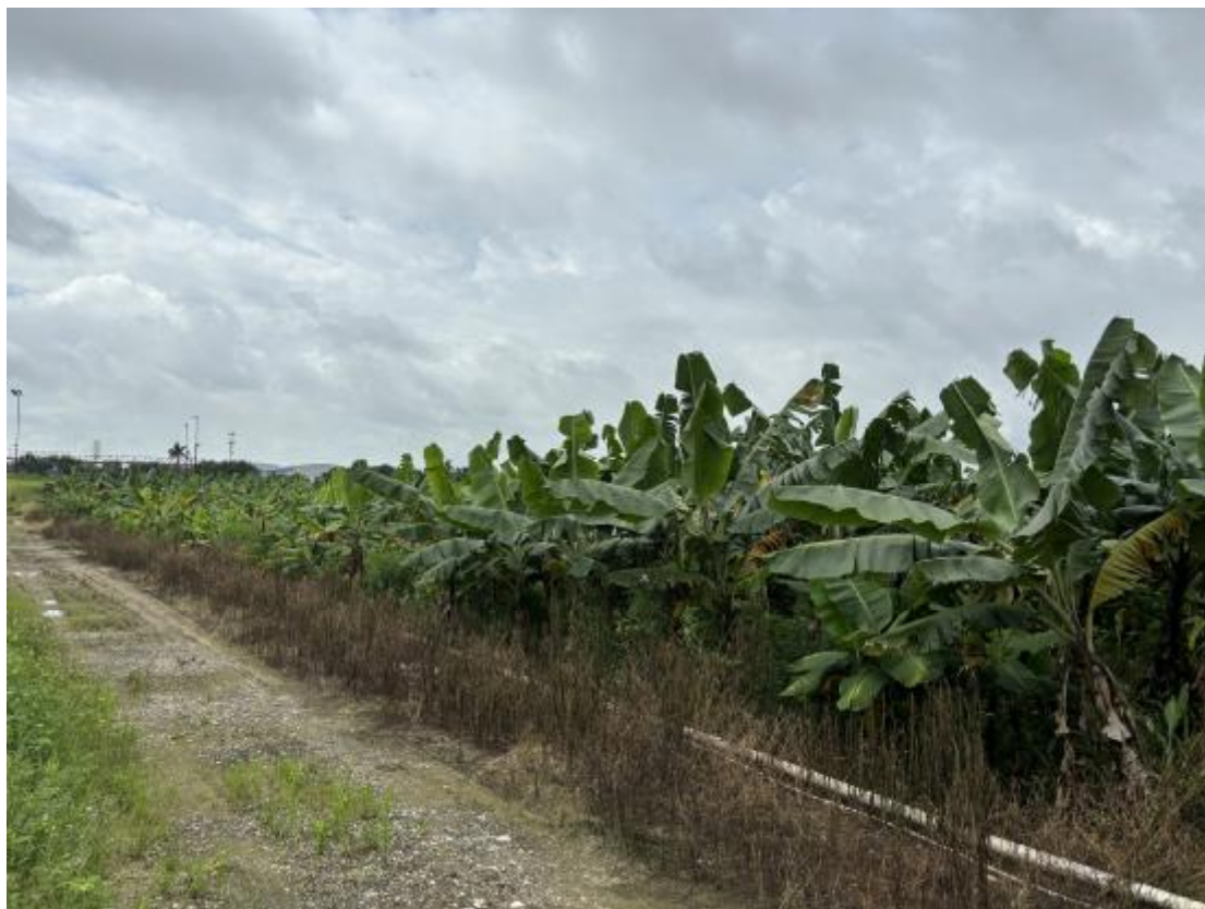
图 24 地块地表现状（东-西）