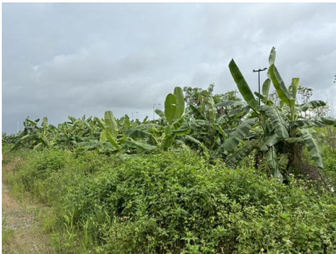
图 21 地块地表现状（东-西）