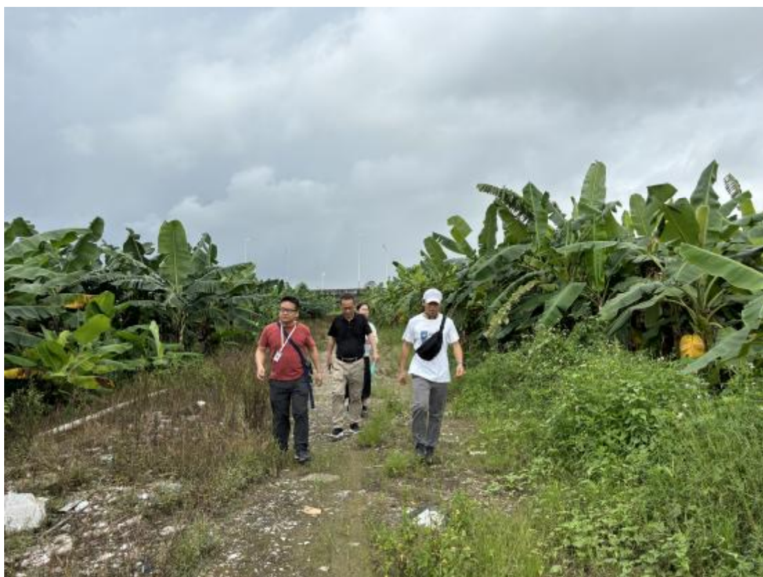
图 7 对地块地表进行踏查（东-西）