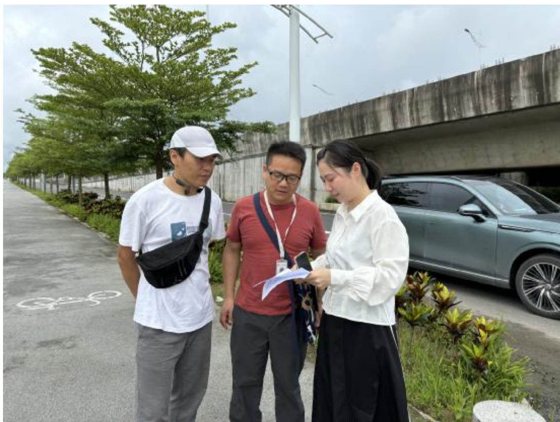
图 6 与现场工作人员确定地块范围（北-南）