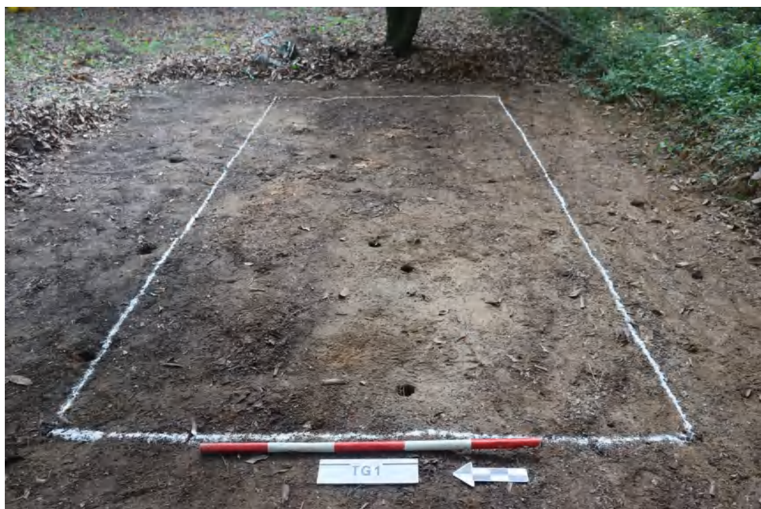
图 54 TG1 布设后全景 (西-东)

①层: 表土层, 厚 0.20-0.35 米, 为灰褐色黏土, 土质疏松, 内含砂砾、植物根系; 该层分布整个探沟, 呈水平分布。以下为黄褐色黏土, 土质致密、纯净, 系生土。