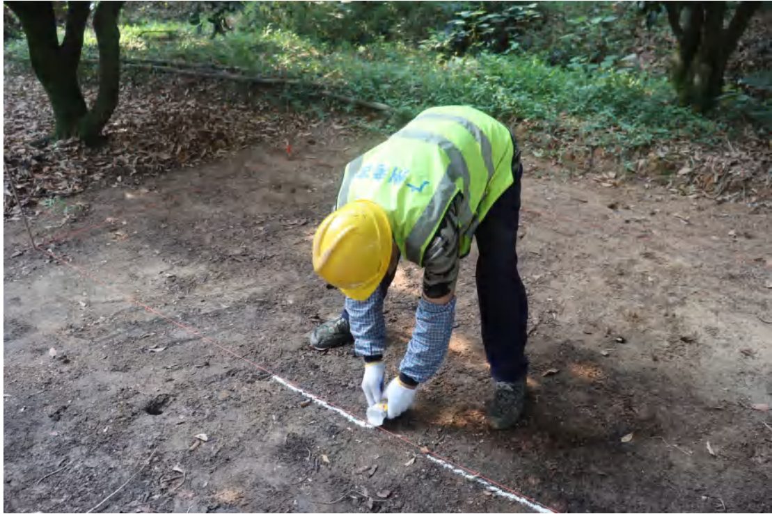
图 48 布设探沟（西北-东南）