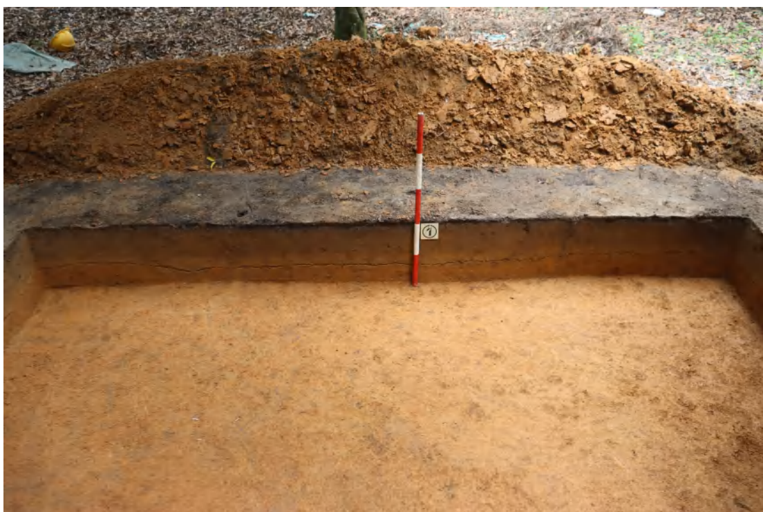
图 56 TG1 北壁剖面（南-北）