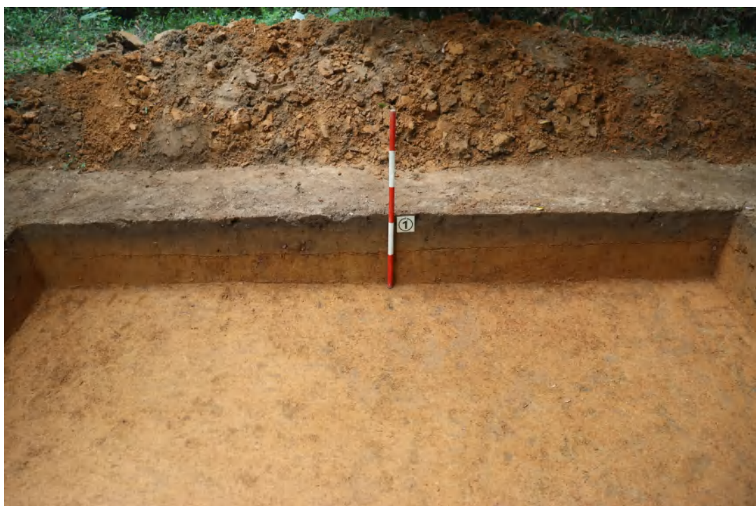
图 58 TG1 南壁剖面（北-南）