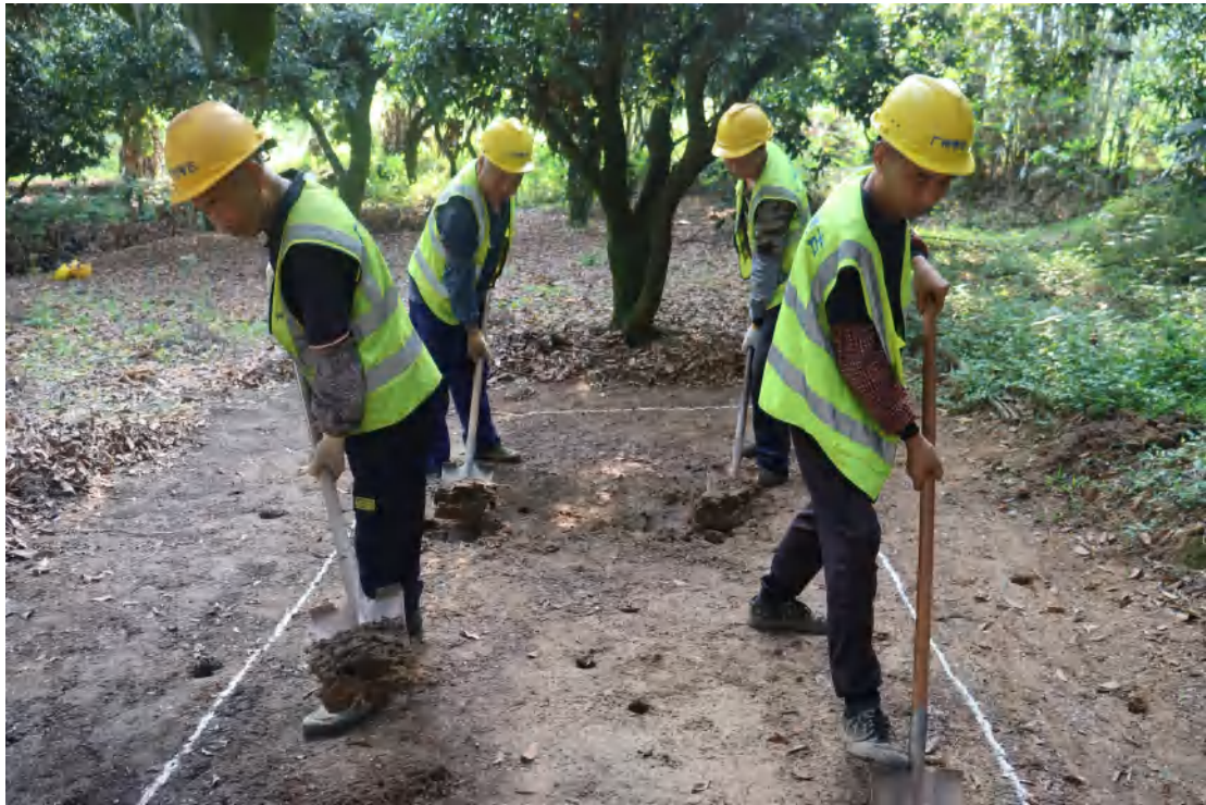
图 49 清理工作照（西-东）