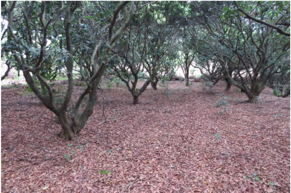
图 21 地块内现状（东北-西南）