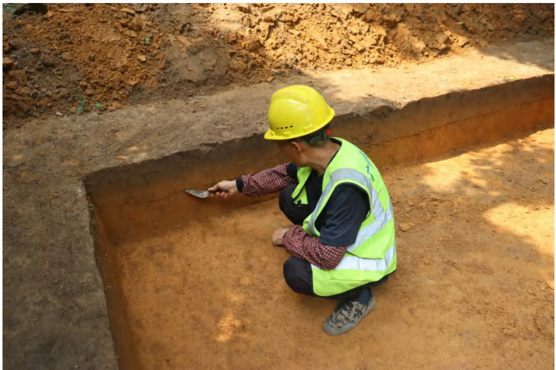
图 51 划分地层线（北-南）