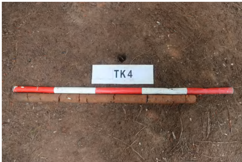
图 38 TK4 土样 (一米标杆,土样由左往右)

①层: 表土层,深 0-0.4 米,厚 0.4 米,为灰褐色黏土,土质疏松,内含砂砾、植物根系。以下为红褐色黏土,土质致密、纯净,系生土。