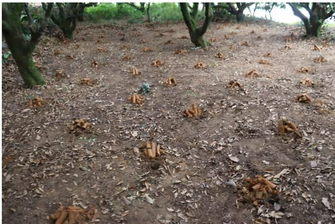
图 31 普探土样