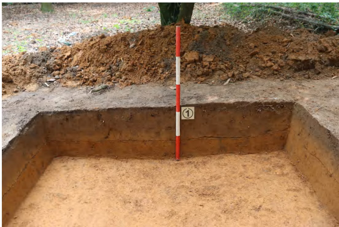
图 57 TG1 东壁剖面（西-东）