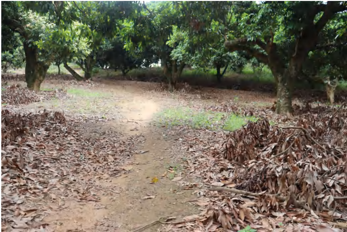
图 9 地块内现状（北-南）