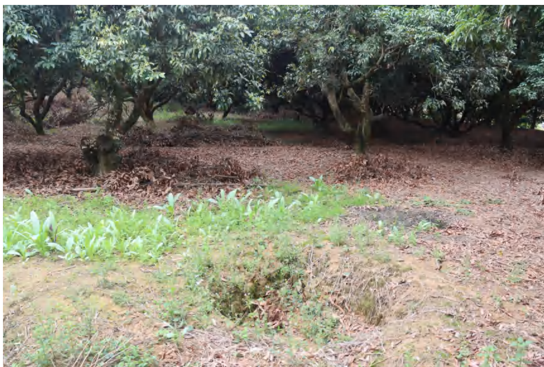
图 13 地块内现状（东-西）