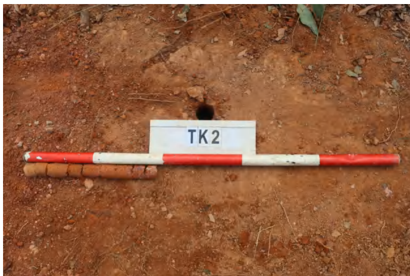
图 36 TK2 土样 (一米标杆, 土样由左往右)

①层: 表土层,深 0-0.05 米,厚 0.05 米,为灰褐色黏土,土质疏松,内含砂砾、植物根系。以下为红褐色黏土,土质致密、纯净,系生土。