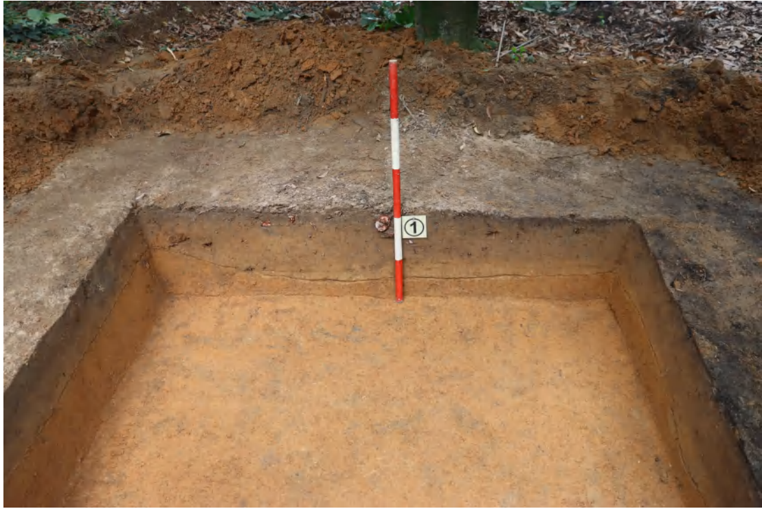
图 59 TG1 西壁剖面（东-西）