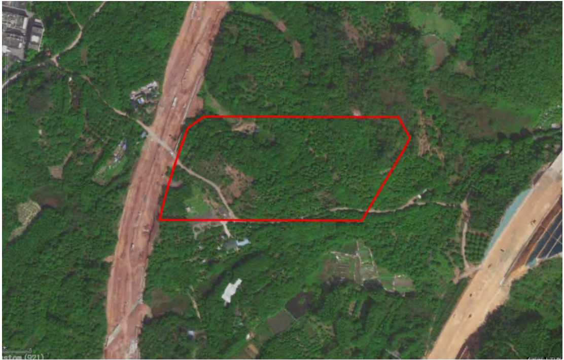
图 4 项目地块红线卫星图（奥维地图）