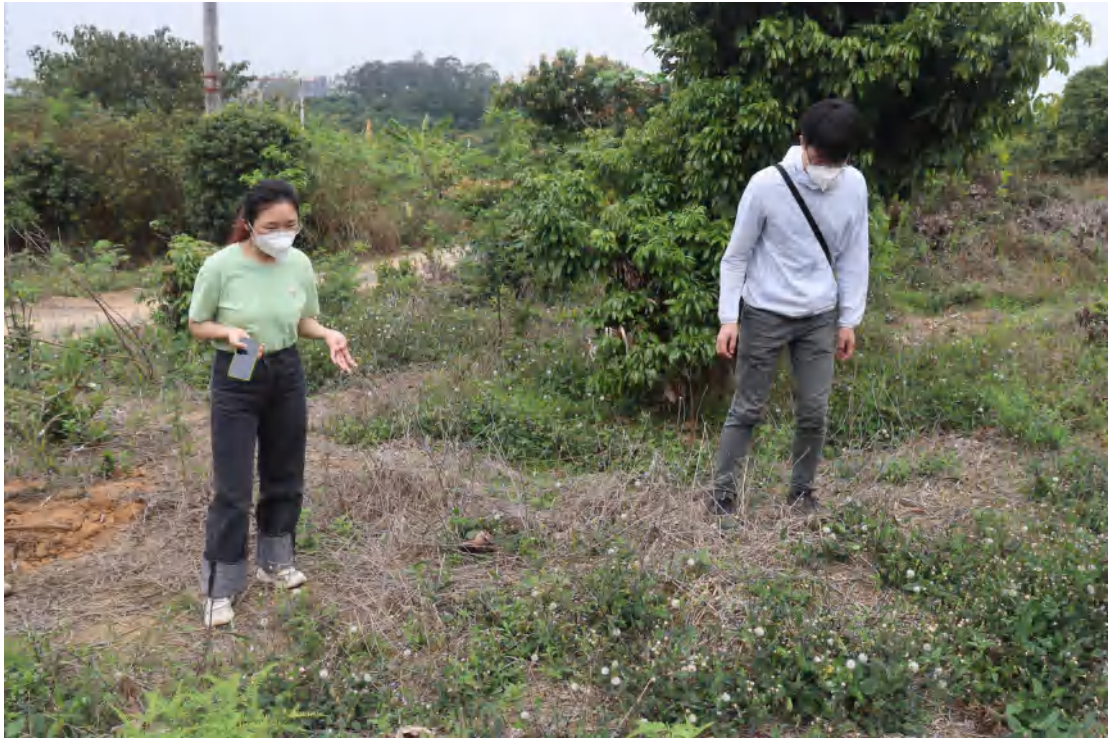
图 8 对地块地表进行现场踏查（南-北）