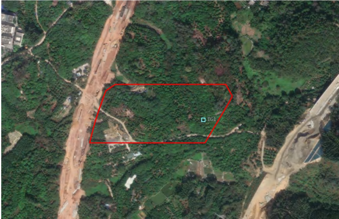
图 45 探沟位置示意图（浅蓝色范围）

根据实际情况，结合探孔勘探的结果，为更好的了解该项目范围内的地层堆积状况。我们采取布置探沟的方式进行进一步考古勘探工作，在红线范围内布置探沟 1 条，编号 TG1, 具体情况如下：