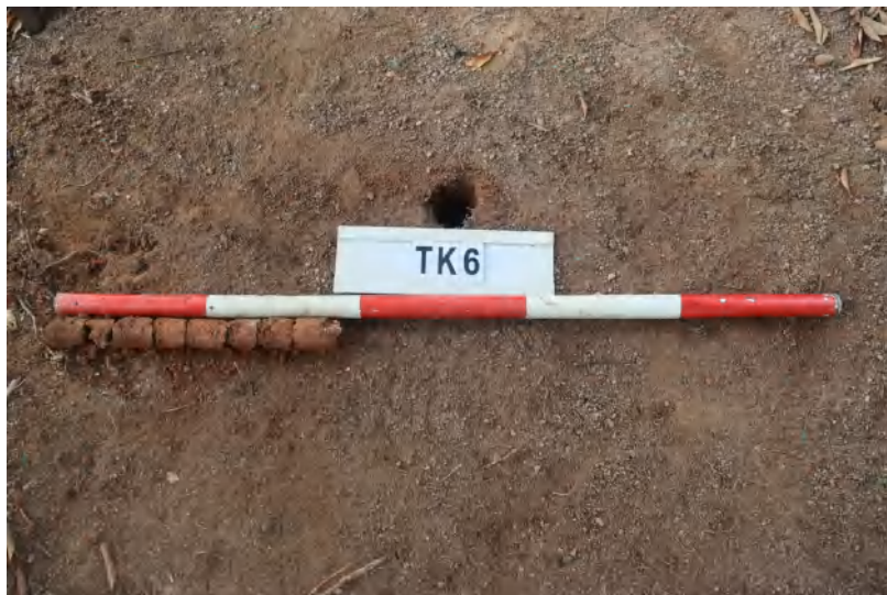
图 40 TK6 土样 (一米标杆, 土样由左往右)

①层: 表土层,深 0-0.3 米,厚 0.3 米,为灰褐色黏土,土质疏松,内含砂砾、植物根系。以下为红褐色黏土,土质致密、纯净,系生土。