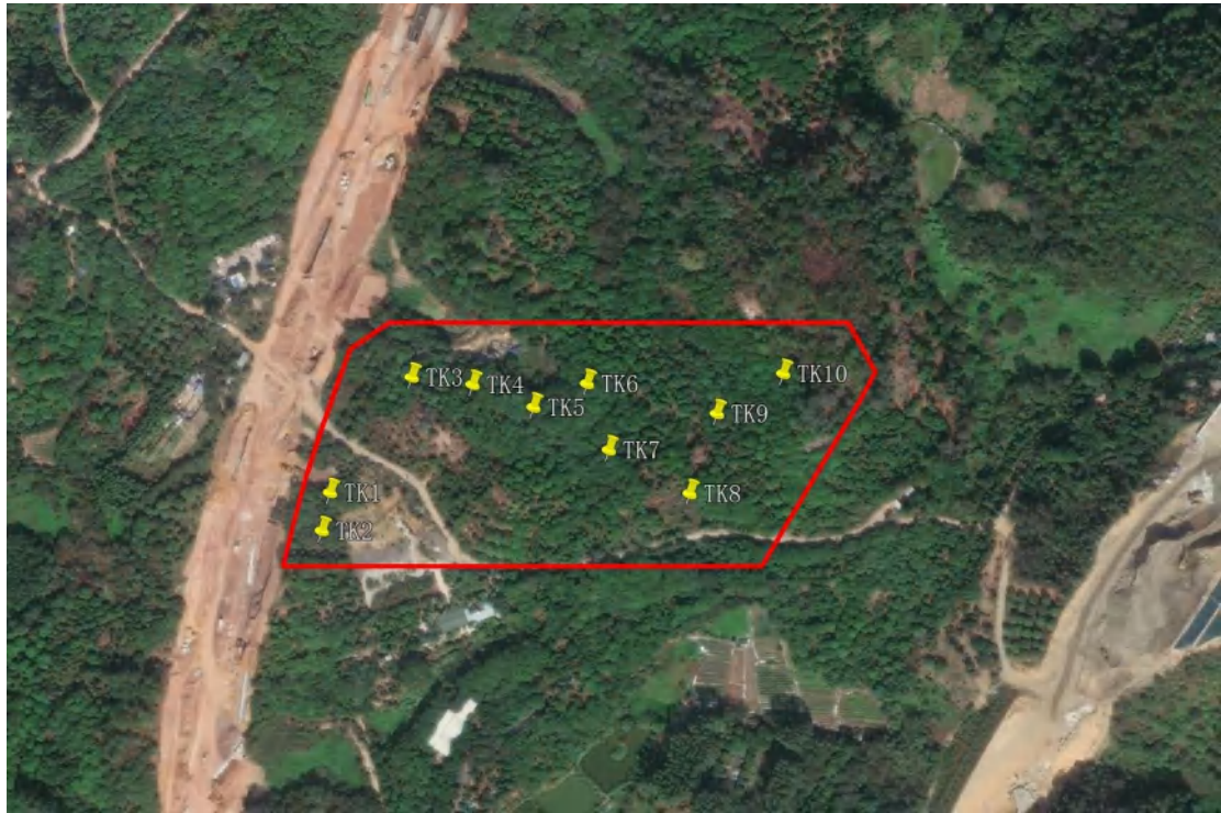
图 25 标准探孔位置示意图（黄色标记点）