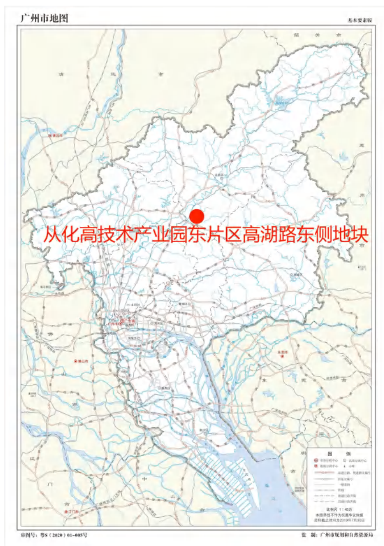
图 1 项目地块在广州市位置示意图（广州市规划和自然资源局）

根据《中华人民共和国文物保护法》《广州市文物保护规定》，按照《广州市文物局关于从化高技术产业园东片区高湖路东侧地块考古调查勘探工作的复函》（文物 20240262 号）指导意见，受广州市从化区土地储备开发中心委托，配合该地块收储出让，我院对该项目地块进行考古调查勘探工作。