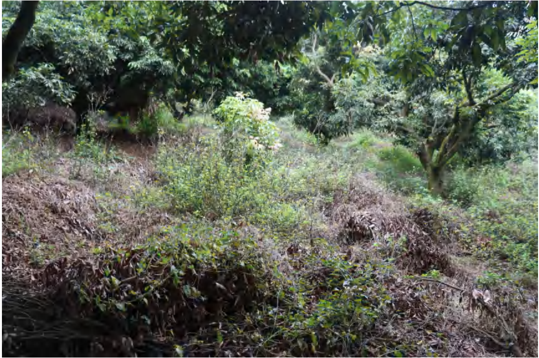
图 16 地块内现状（西-东）