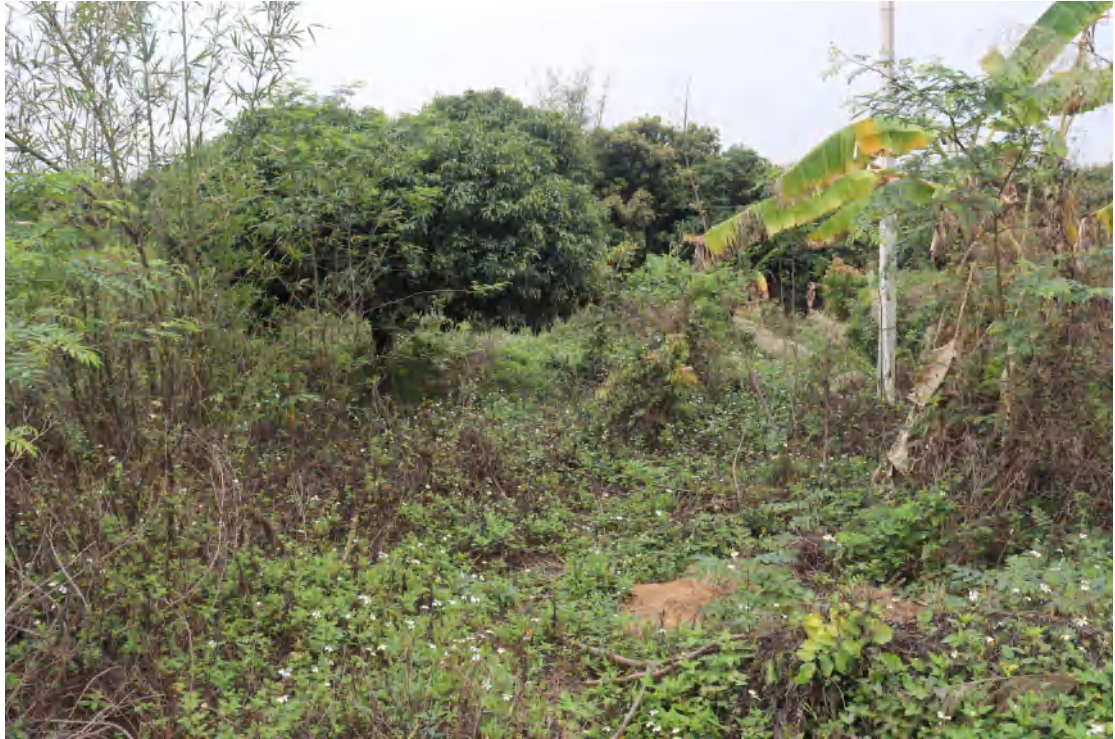
图 10 地块内现状（东北-西南）