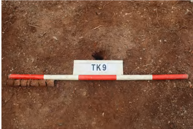
图 43 TK9 土样（一米标杆，土样由左往右）

①层：表土层，深 0-0.05 米，厚 0.05 米，为灰褐色黏土，土质疏松，内含砂砾、植物根系。以下为红褐色黏土，土质致密、纯净，系生土。