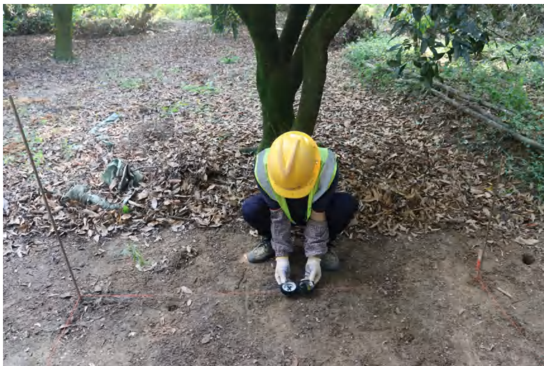
图 47 罗盘定向（西-东）