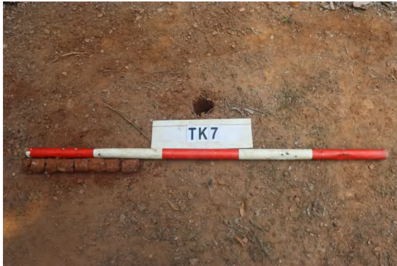
图 41 TK7 土样 (一米标杆,土样由左往右)

①层: 表土层,深 0-0.1 米,厚 0.1 米,为灰褐色黏土,土质疏松,内含砂砾、植物根系。以下为红褐色黏土,土质致密、纯净,系生土。