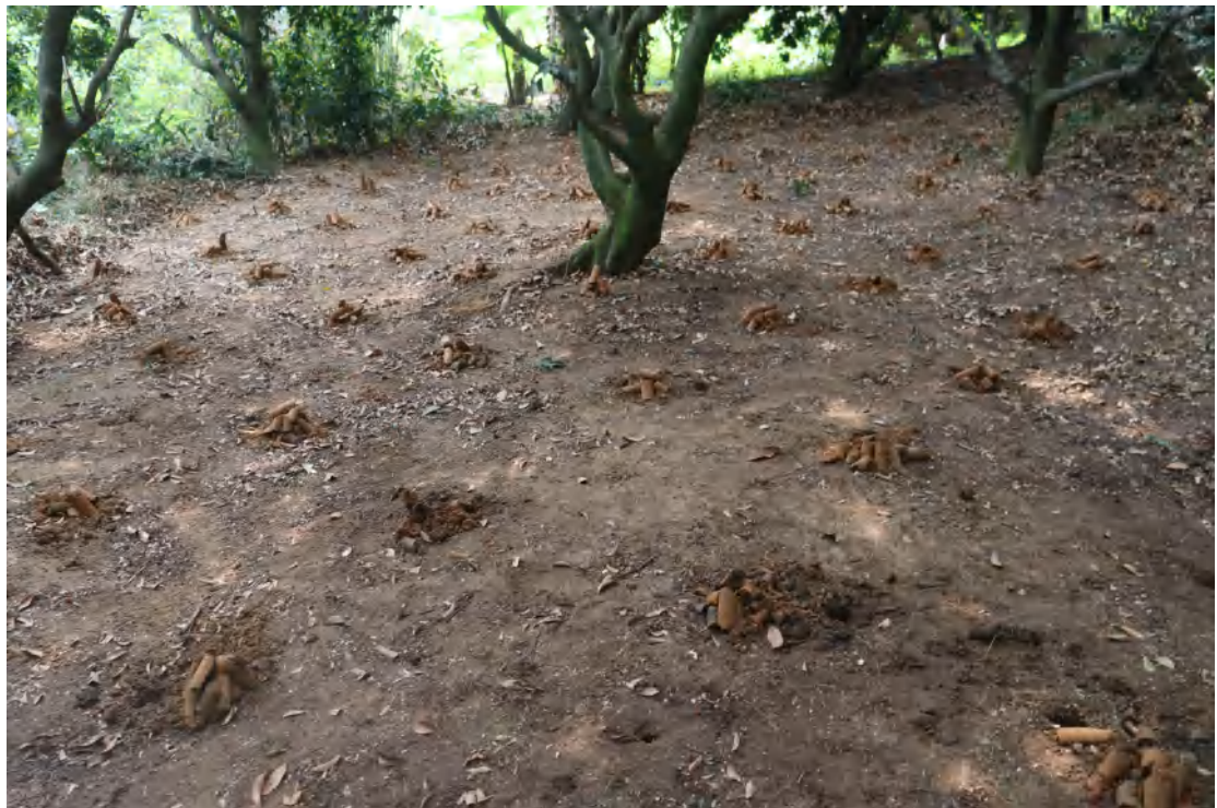
图 30 普探土样