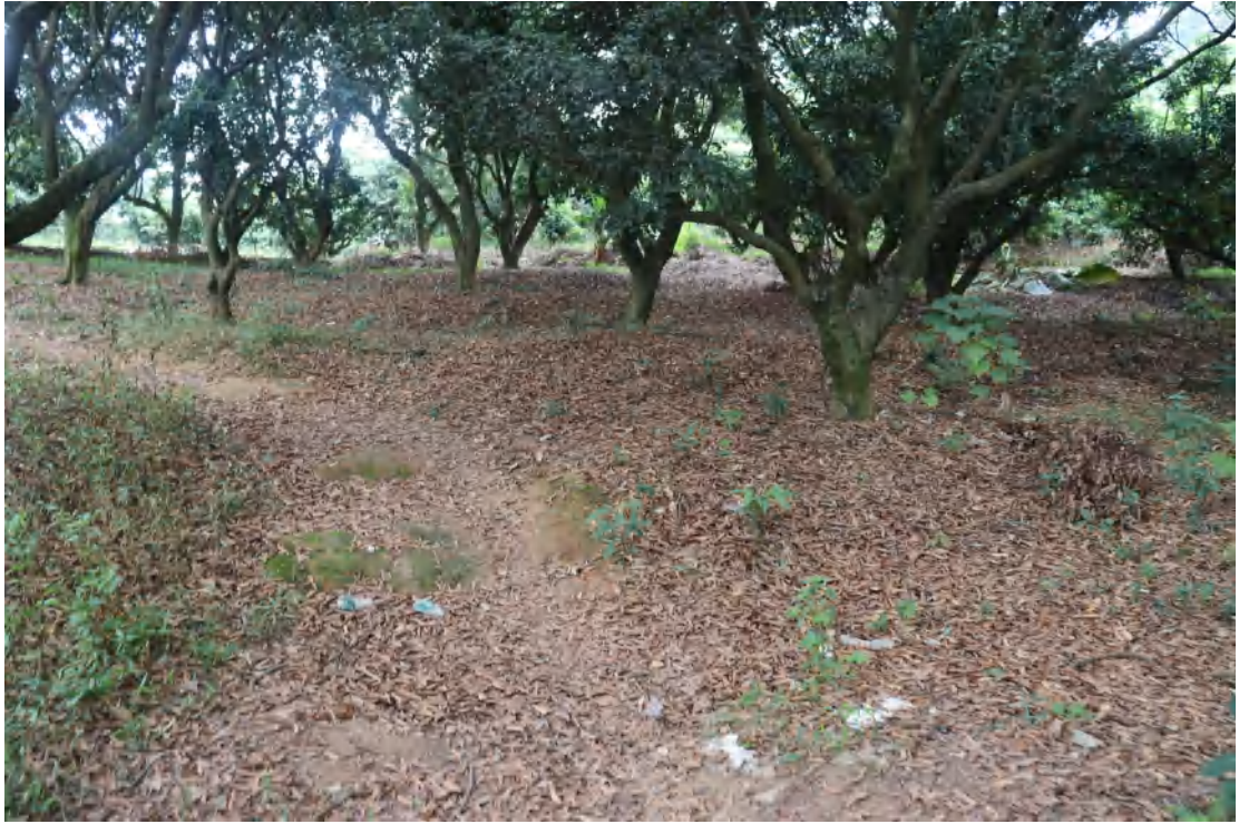
图 27 勘探区域现状（南-北）