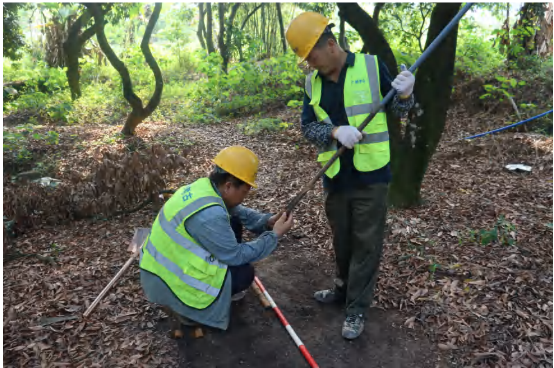
图 34 标准探孔土样分析工作照（西-东）