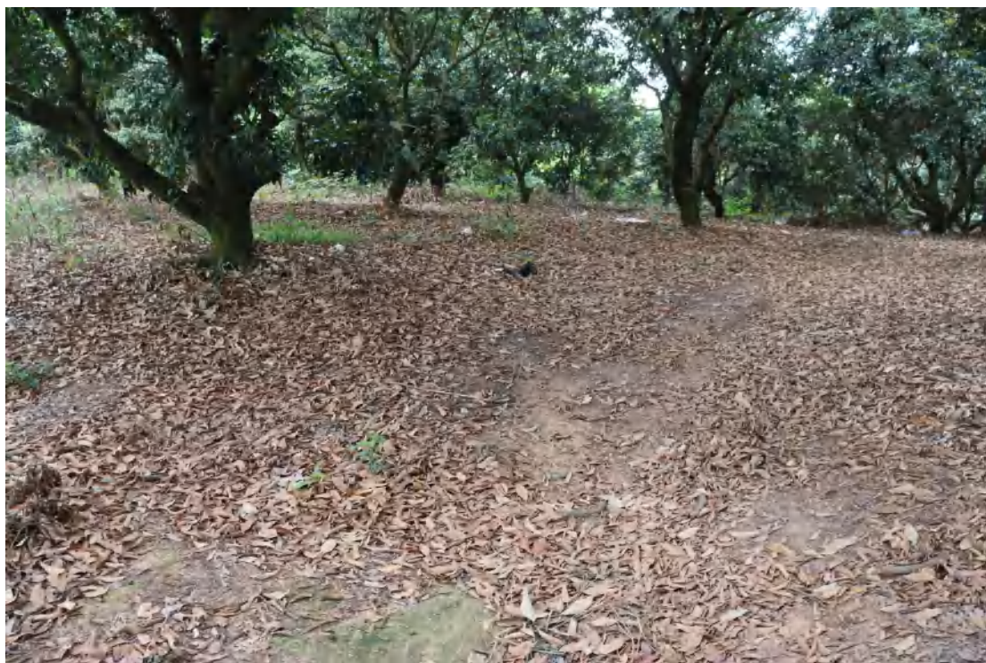
图 12 地块内现状（东南-西北）