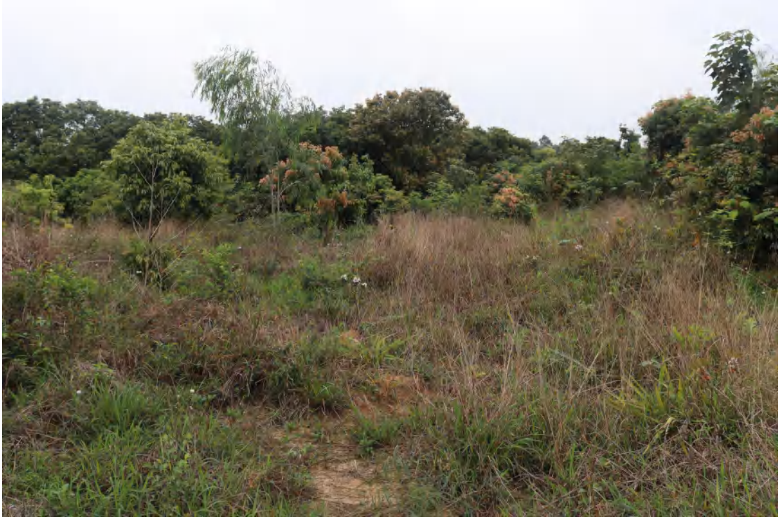
图 18 地块内现状（西南-东北）