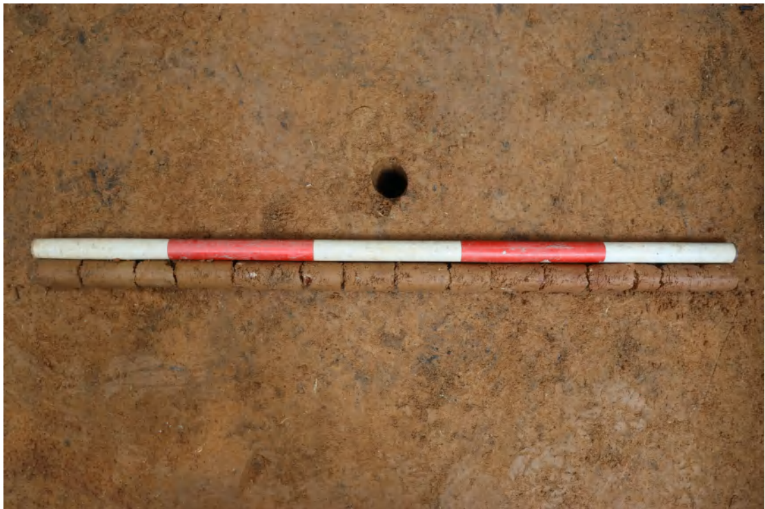
图 60 TG1 底部探孔土样（一米标尺, 土样由左到右）