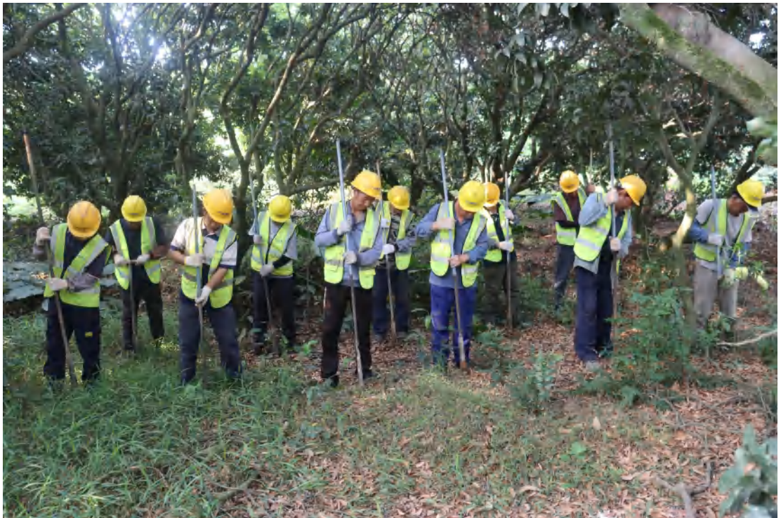
图 28 普探工作照（北-南）