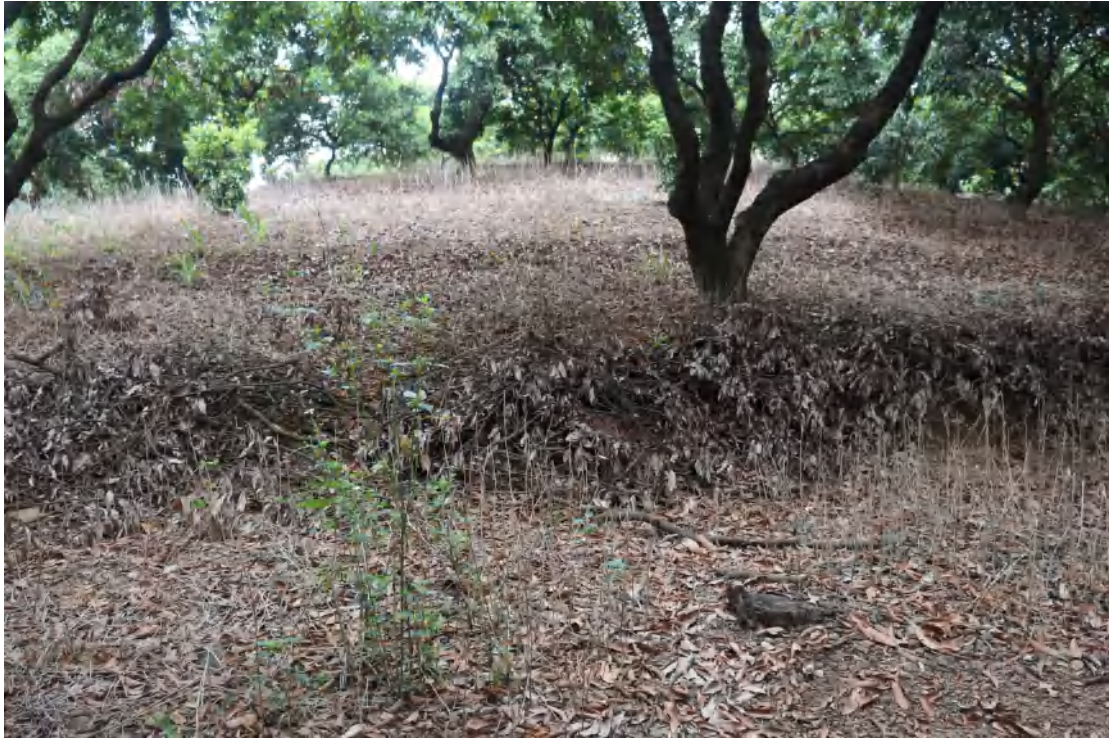
图 14 地块内现状（南-北）