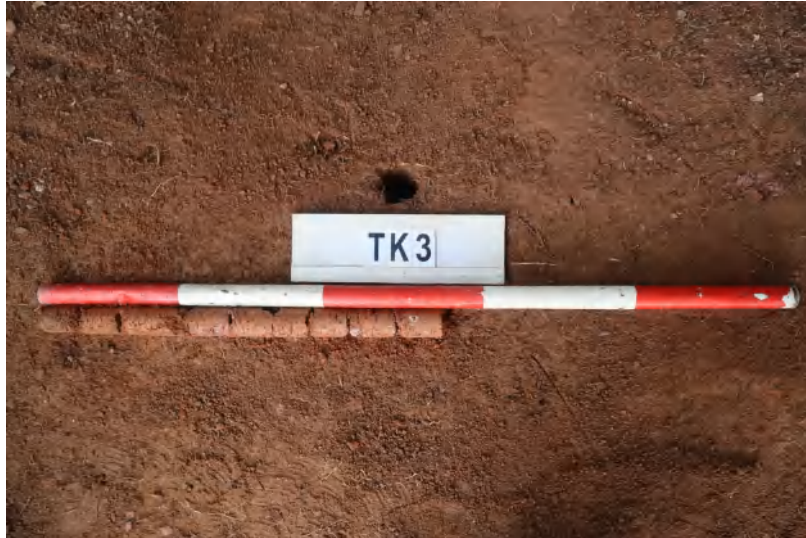
图 37 TK3 土样 (一米标杆,土样由左往右)

①层: 表土层,深 0-0.2 米,厚 0.2 米,为灰褐色黏土,土质疏松,内含砂砾、植物根系。以下为红褐色黏土,土质致密、纯净,系生土。