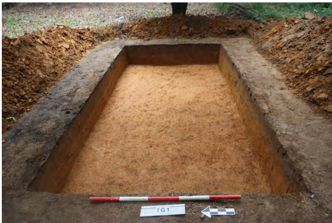
图 55 TG1 清理完成后全景（西-东）