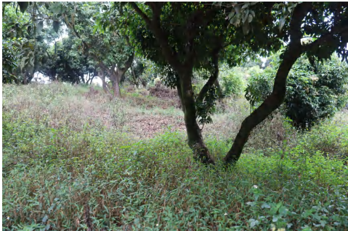
图 26 勘探区域现状（南-北）