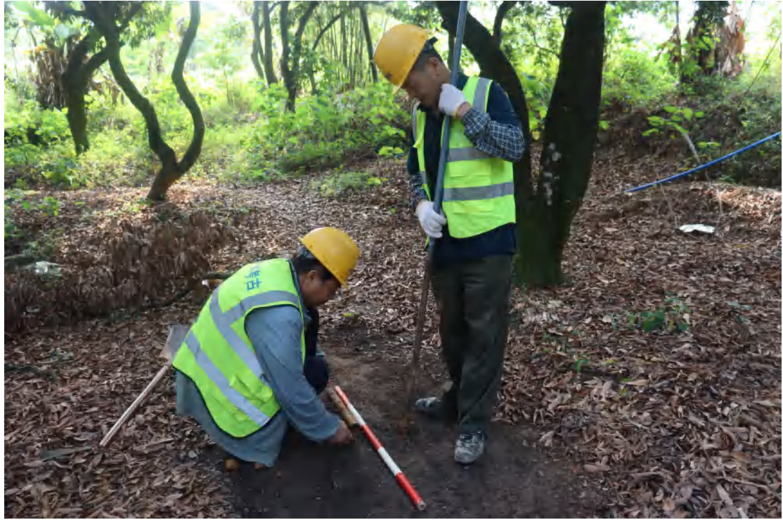
图 33 标准探孔提取土样工作照（西-东）