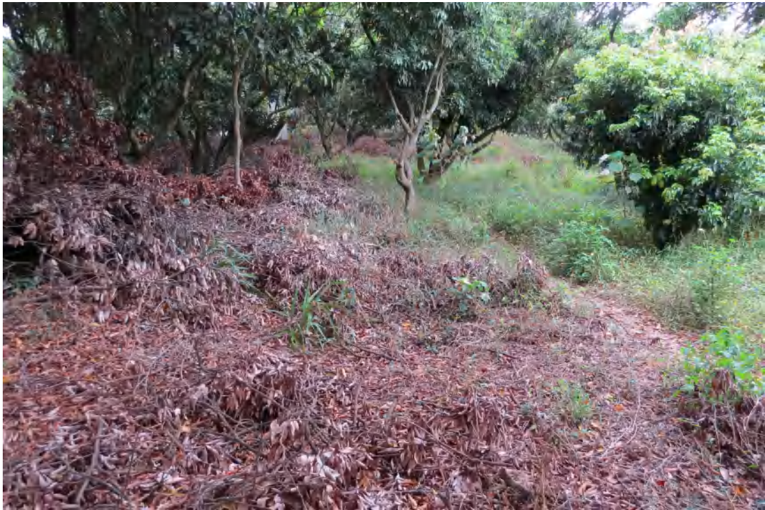
图 23 地块内现状（西南-东北）