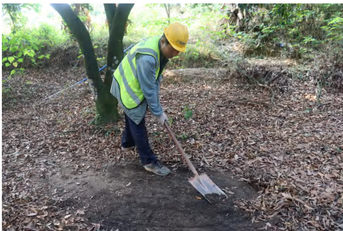
图 32 标准探孔清表工作照（东北-西南）