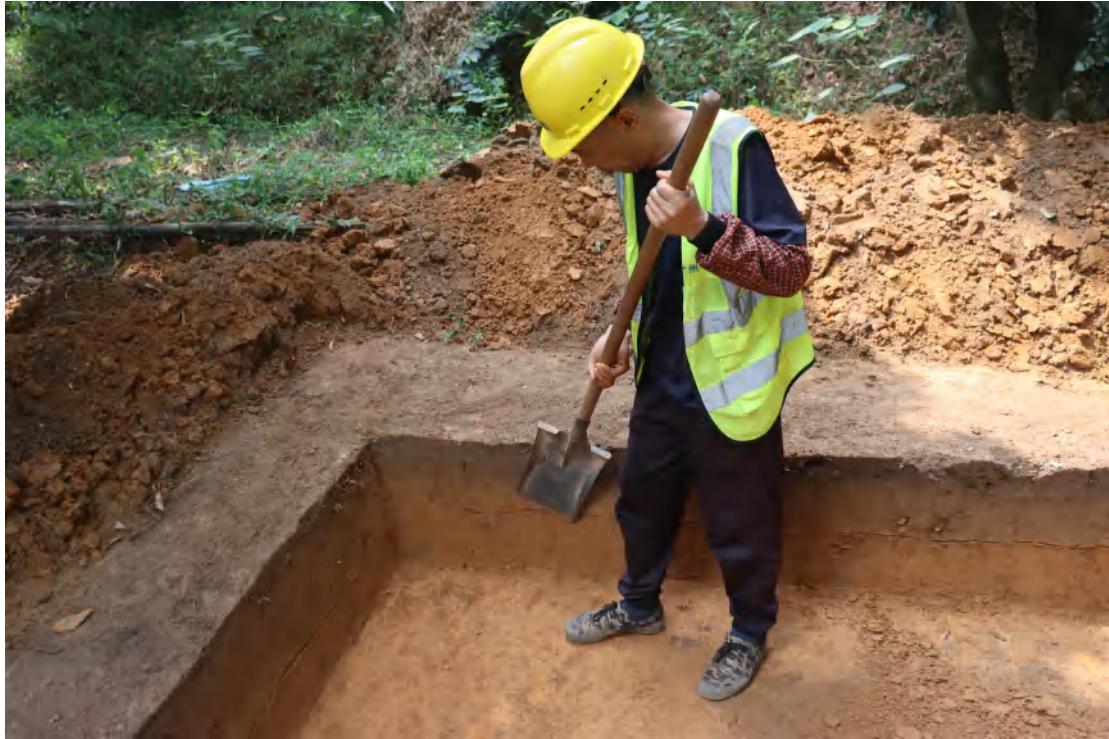
图 52 修整探沟壁（北-南）