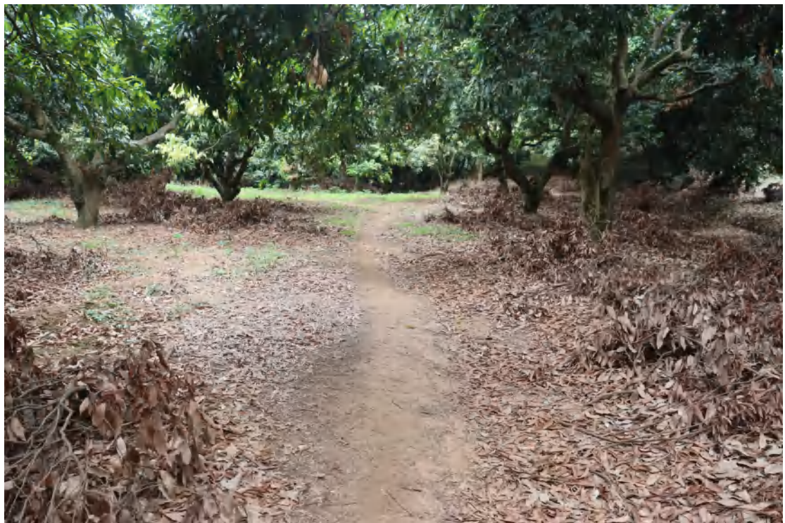
图 11 地块内现状（东南-西北）