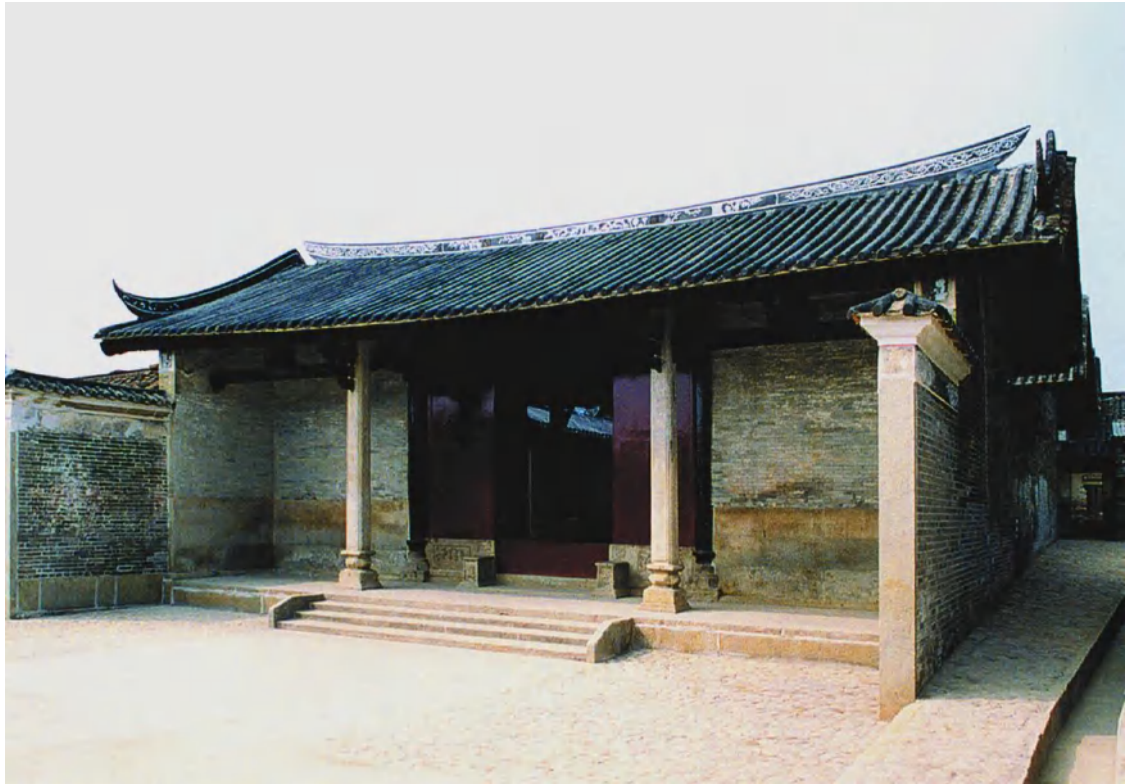
图 6 广裕祠

广裕祠 坐落在广州市历史文化保护区钱岗村中央位置处，依地势而建。广裕祠被专家誉称为“岭南地区古祠堂建筑的年代标尺”，2006年5月，由国务院公布为国家重点文物保护单位。广裕祠曾获2003年度联合国教科文组织亚太地区文化遗产保护杰出项目奖第一名，以褒奖中国民间力量在政府的组织协调下对文化遗产保护所作出的成绩。