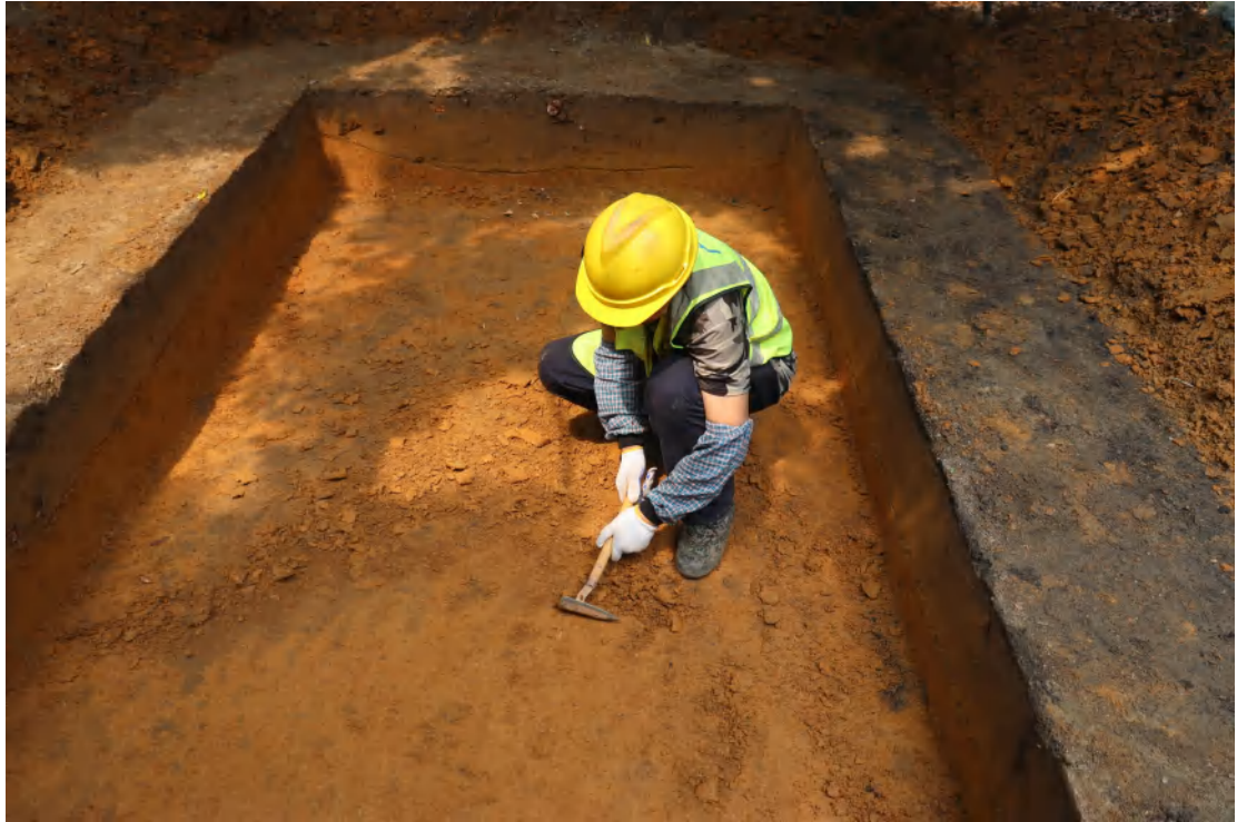
图 50 底部刮面（东-西）