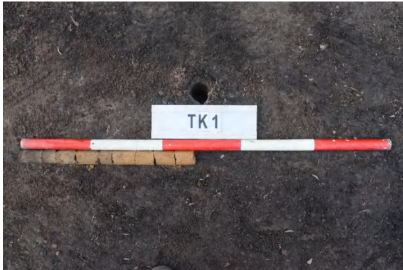
图 35 TK1 土样 (一米标杆, 土样由左往右)

①层: 表土层,深 0-0.22 米,厚 0.22 米,为灰褐色黏土,土质疏松,内含砂砾、植物根系。以下为黄褐色黏土,土质致密,纯净,系生土。