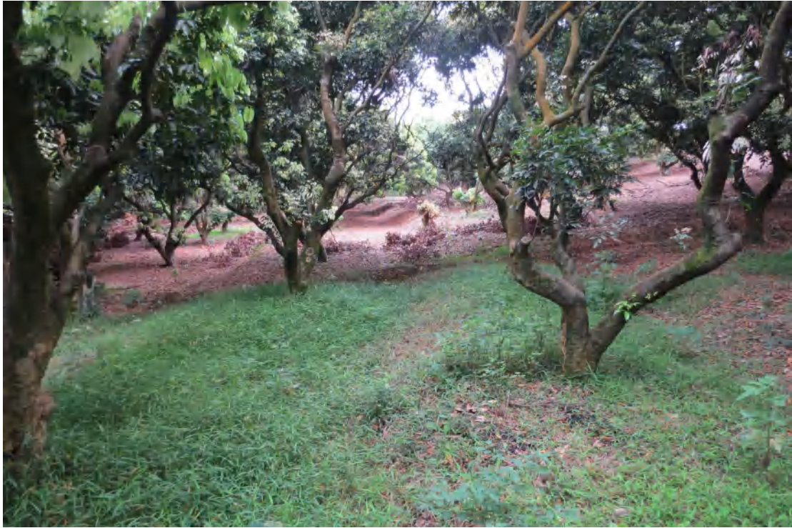
图 22 地块内现状（西北-东南）