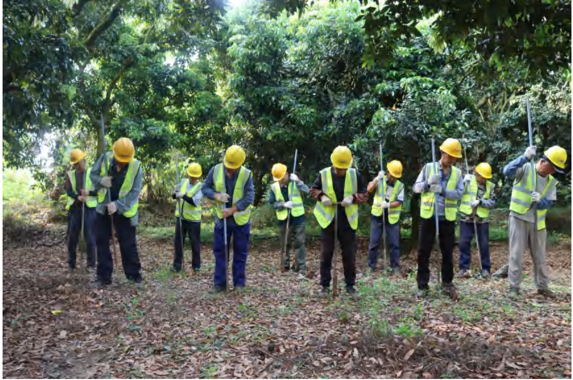
图 29 普探工作照（北-南）