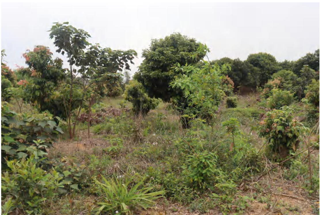
图 17 地块内现状（西-东）