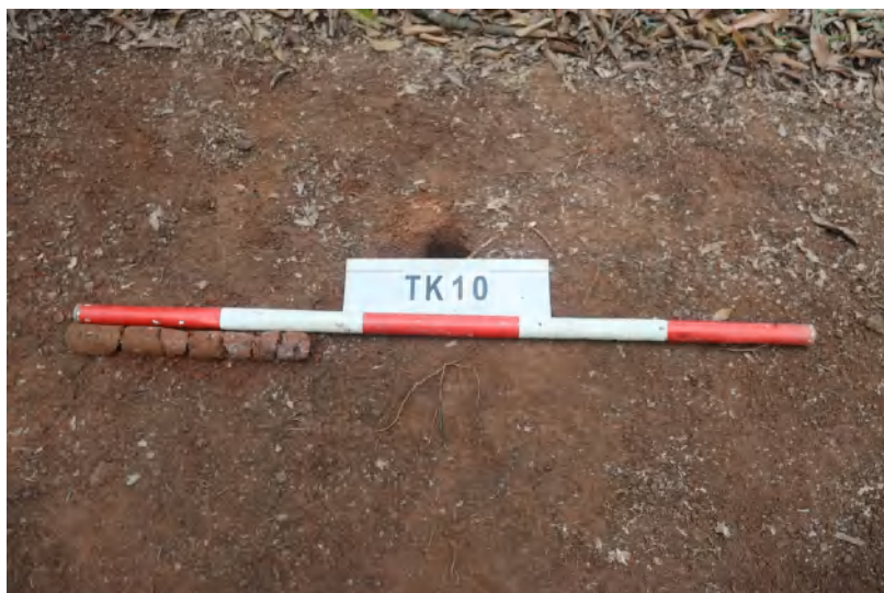
图 44 TK10 土样（一米标杆，土样由左往右）

①层：表土层，深 0-0.2 米，厚 0.2 米，为灰褐色黏土，土质疏松，内含砂砾、植物根系。以下为红褐色黏土，土质致密、纯净，系生土。