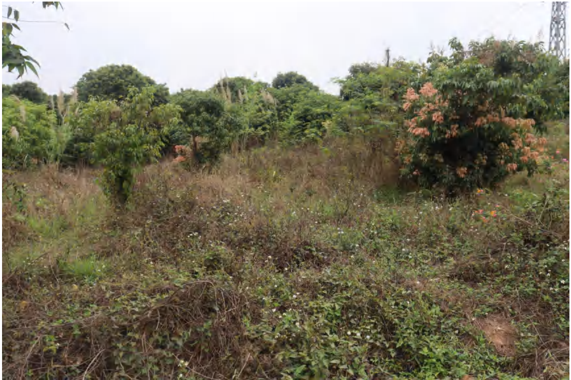
图 19 地块内现状（西南-东北）