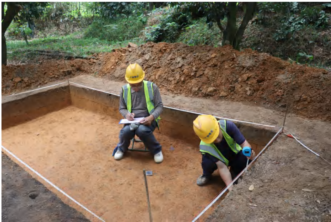
图 53 现场绘图（东北-西南）