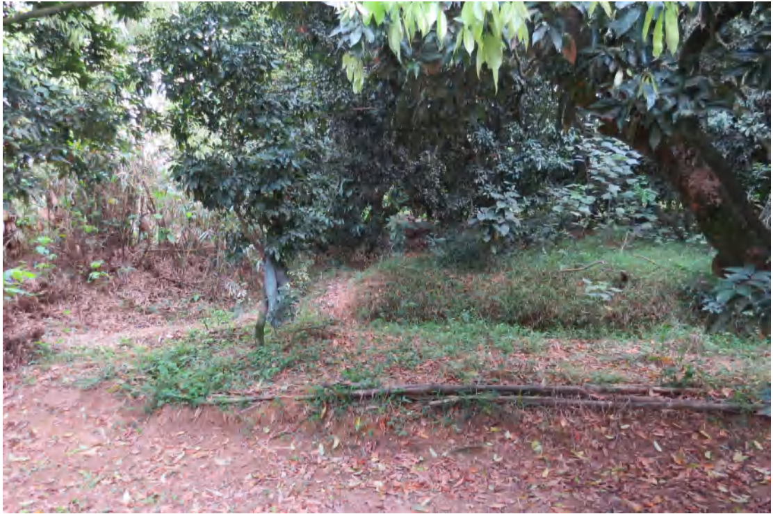
图 20 地块内现状（北-南）