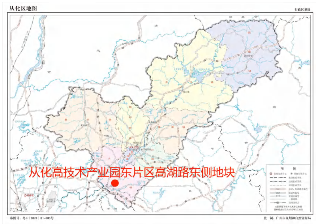
图 2 项目地块在从化区位置示意图（广州市规划和自然资源局）