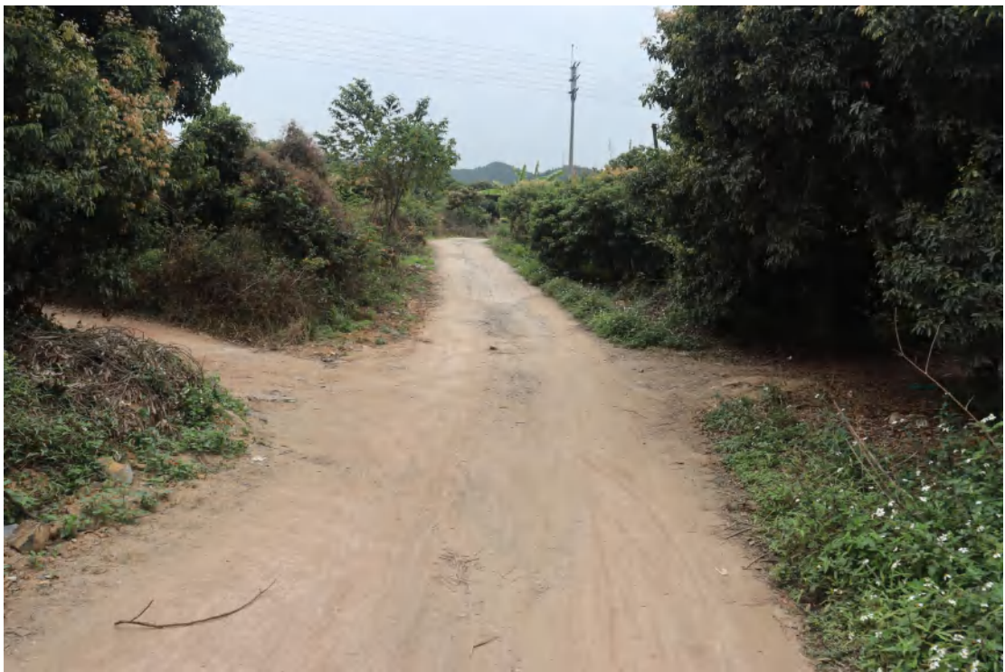
图 15 地块内现状（西北-东南）