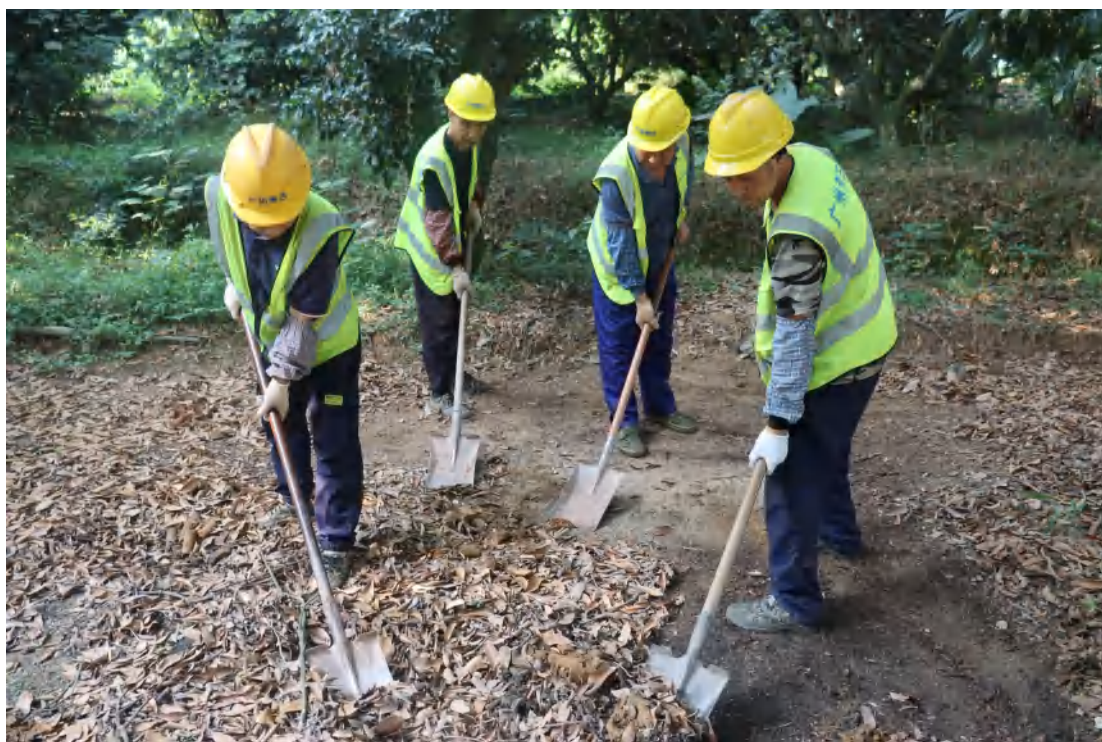
图 46 清表工作照（北-南）