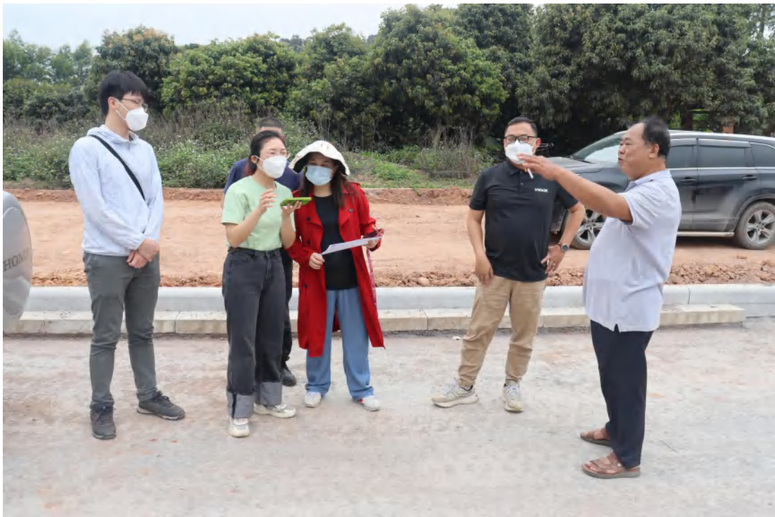
图7 工作人员确认地块范围（东南-西北）

此次考古调查不足以全面反映地块内的文物埋藏情况。结合周边考古成果，为确认该地块范围内的文物埋藏情况，需对该地块作进一步的考古勘探。