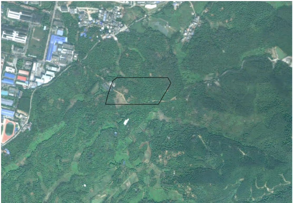
图 5 项目地块红线影像图