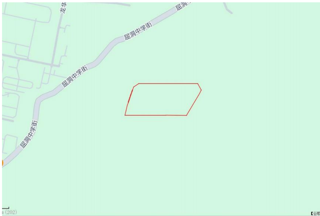
图 3 项目地块周边环境示意图（奥维地图）