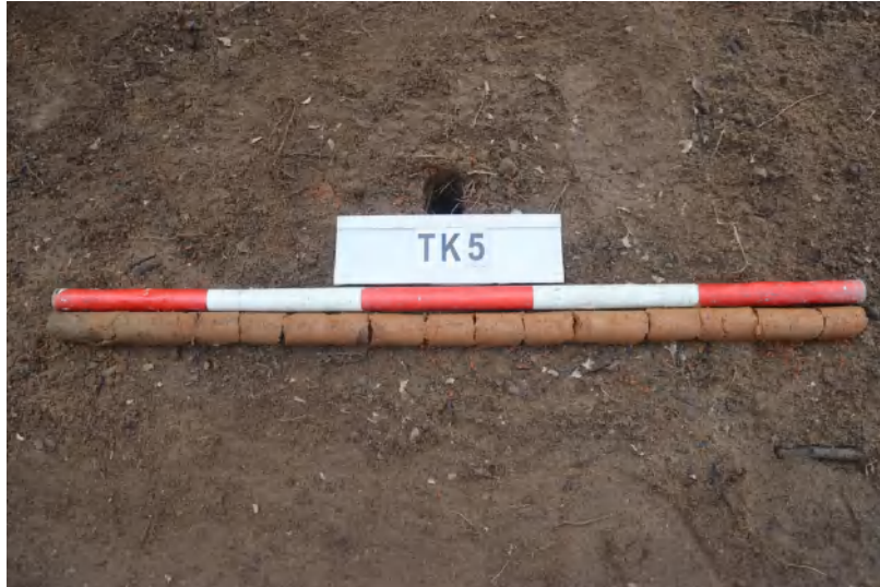
图 39 TK5 土样 (一米标杆, 土样由左往右)

①层: 表土层,深 0-0.4 米,厚 0.4 米,为灰褐色黏土,土质疏松,内含砂砾、植物根系。以下为黄褐色黏土,土质致密、纯净,系生土。