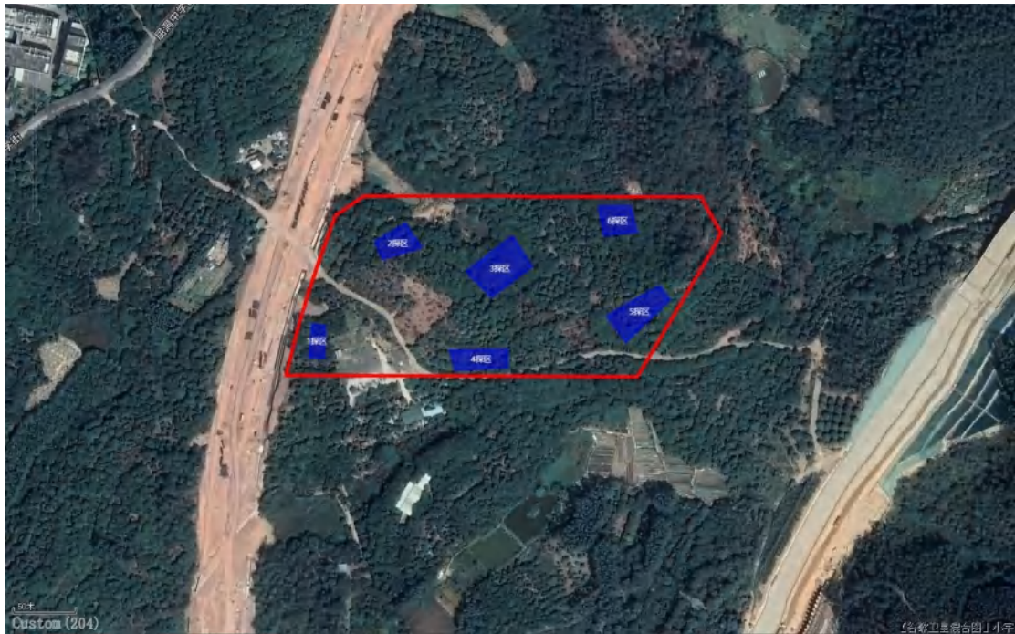
图 24 勘探区域分布示意图（蓝色范围为勘探区域）

通过考古调查，我院对从化高技术产业园东片区高湖路东侧地块的基本情况有了初步了解。根据调查结果，结合周边考古成果及地形地貌，我院对该项目范围总面积 10%进行普通勘探工作。本次共划分有 5 个探区，勘探面积 4500 平方米，布设探孔约 4000 个，提取标准探孔 10 个，编号分别为 TK1-TK10，具体情况如下：