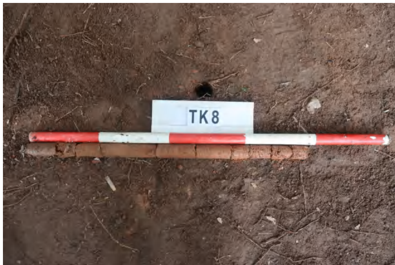
图 42 TK8 土样 (一米标杆,土样由左往右)

①层: 表土层,深 0-0.5 米,厚 0.5 米,为灰褐色黏土,土质疏松,内含砂砾、植物根系。以下为黄褐色黏土,土质致密、纯净,系生土。