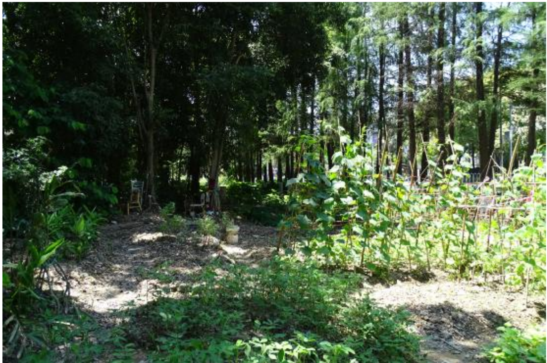
图 19 地块地表现状（北-南）