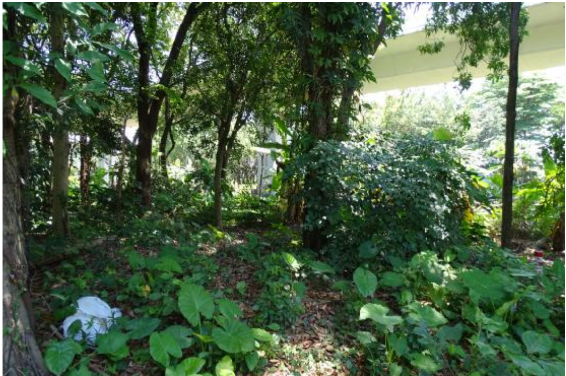
图 17 地块地表现状（南-北）