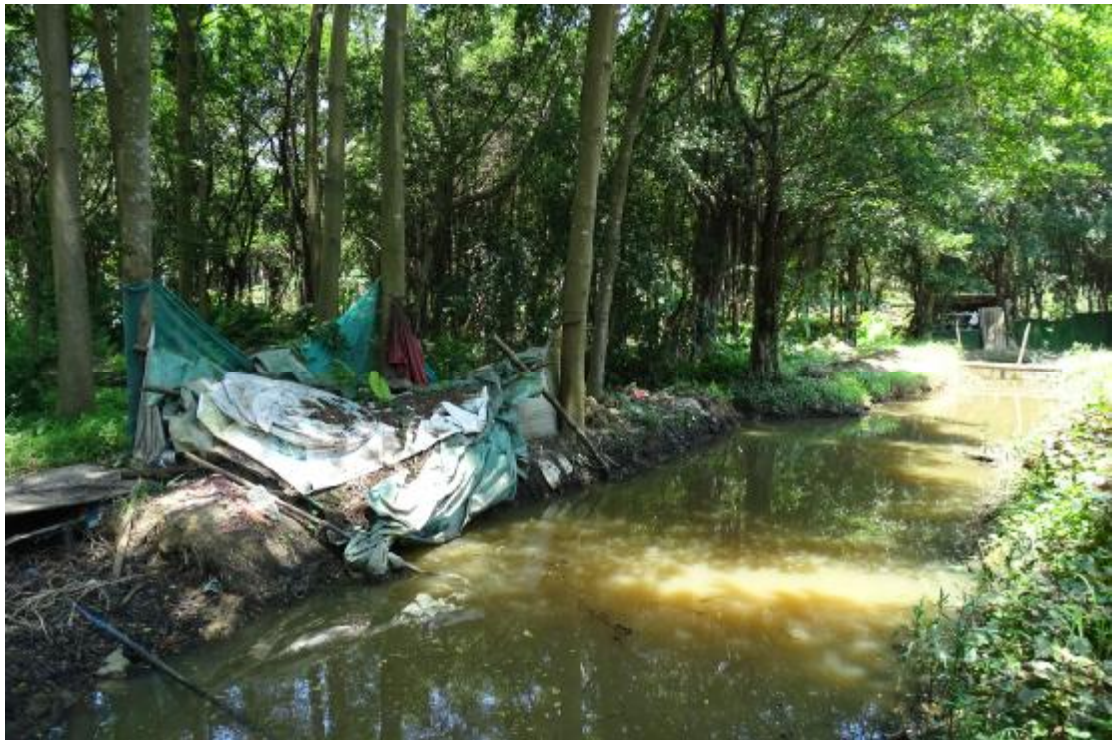
图 23 地块地表现状（南-北）