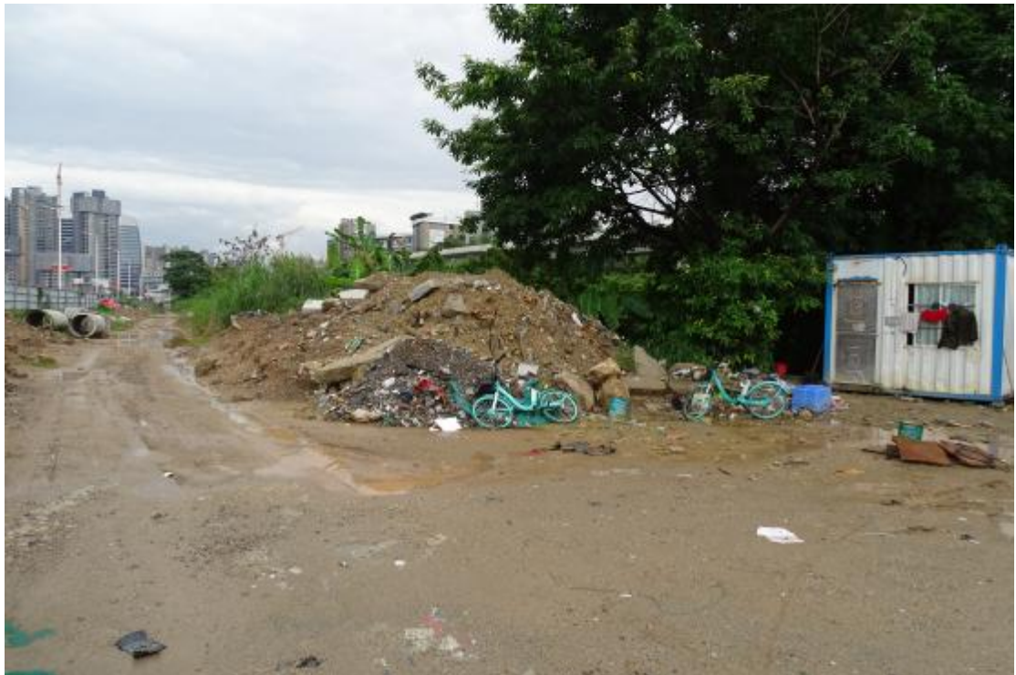
图 15 地块地表现状（北-南）