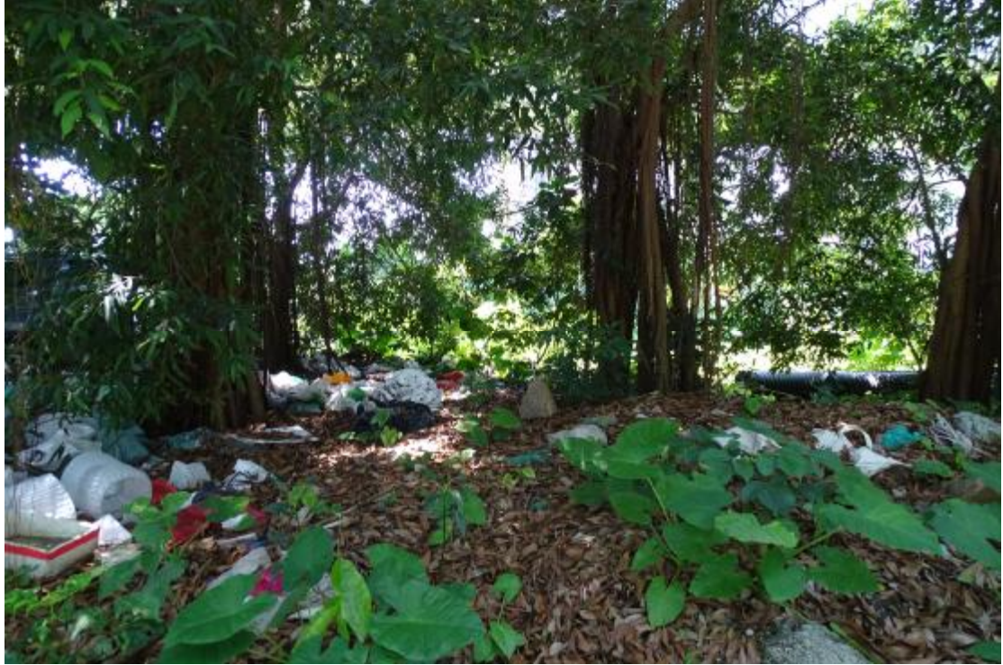
图 30 地块地表现状（西-东）