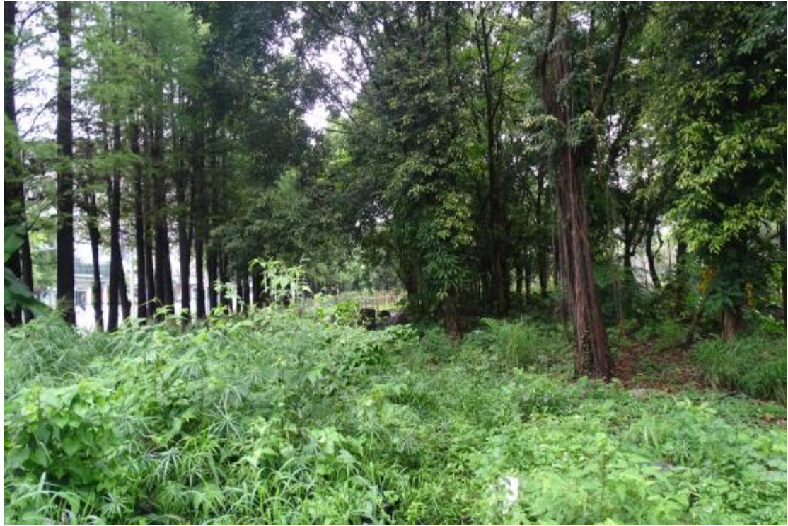
图 8 地块地表现状（南-北）