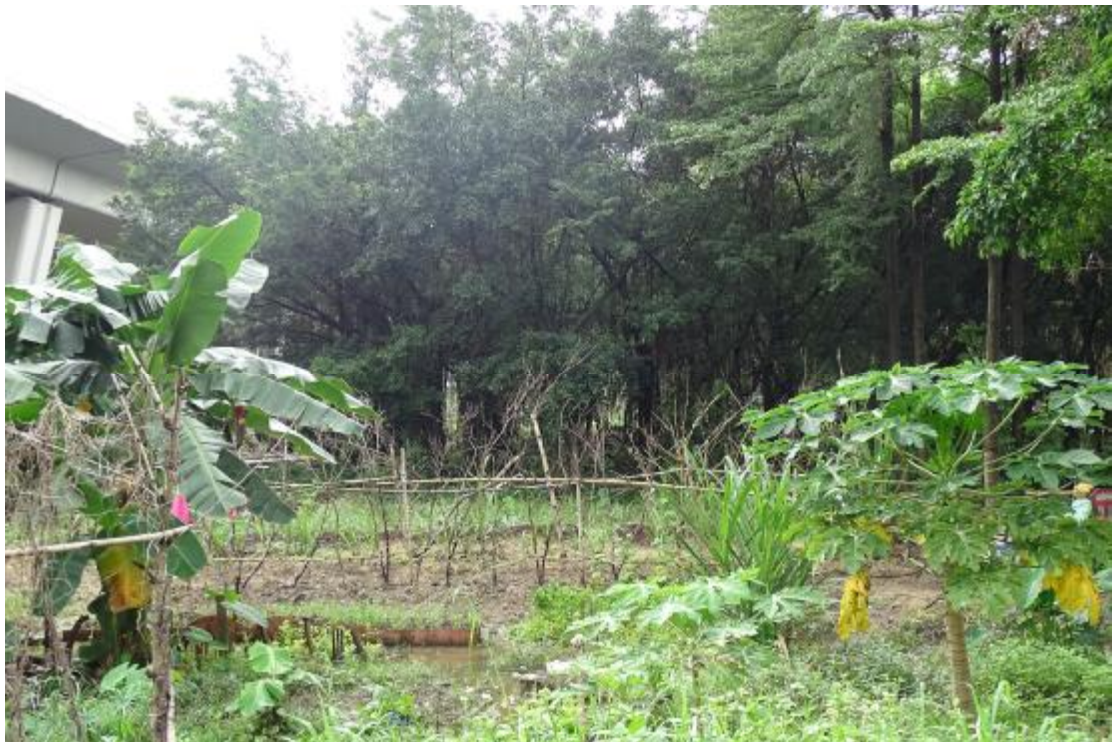
图 13 地块地表现状（南-北）