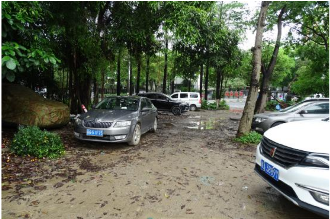
图 27 地块地表现状（北-南）