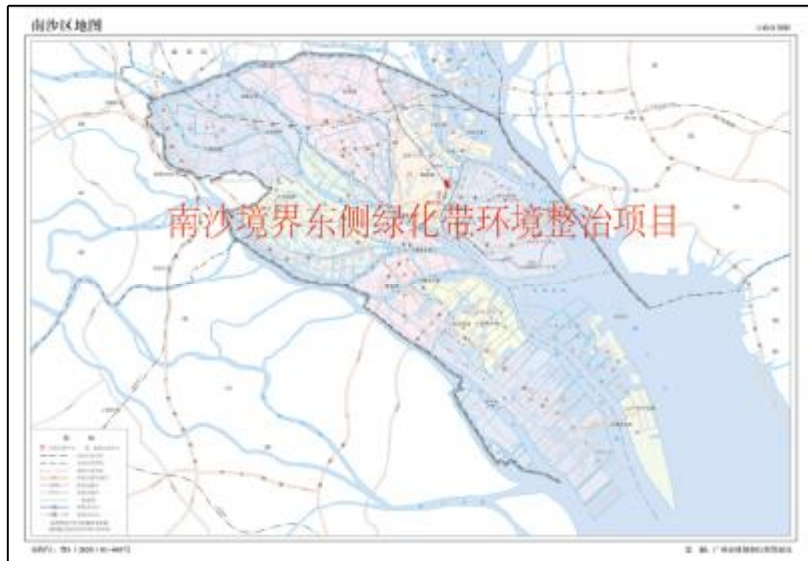
图 2 项目地块在南沙区的位置示意图（广州市规划和自然资源局）