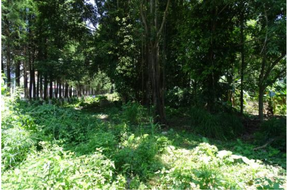
图 16 地块地表现状（南-北）