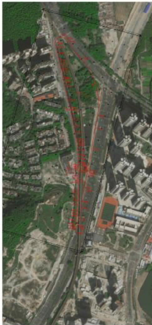
图 3 项目规划红线图