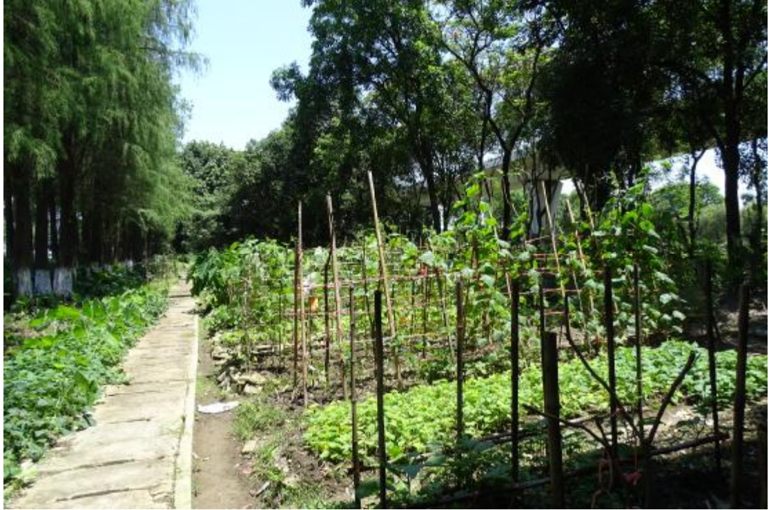
图 18 地块地表现状（南-北）