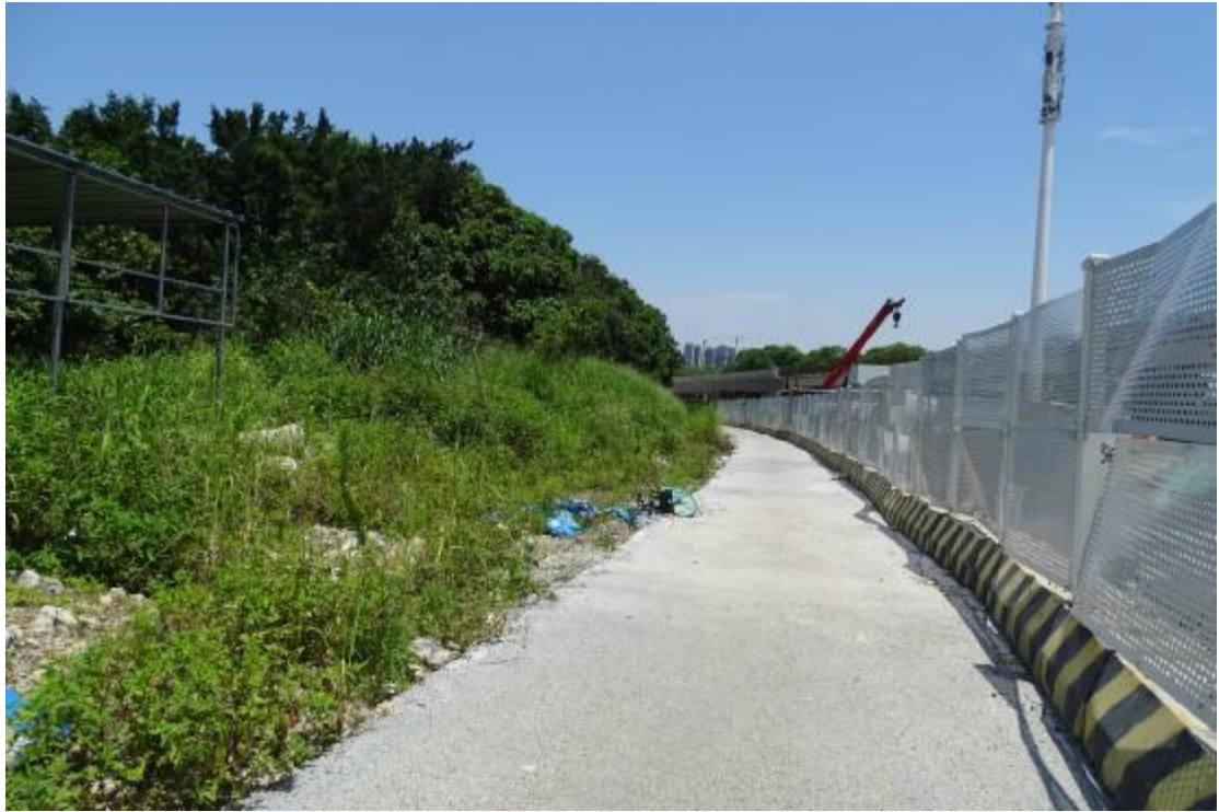
图 22 地块地表现状（南-北）