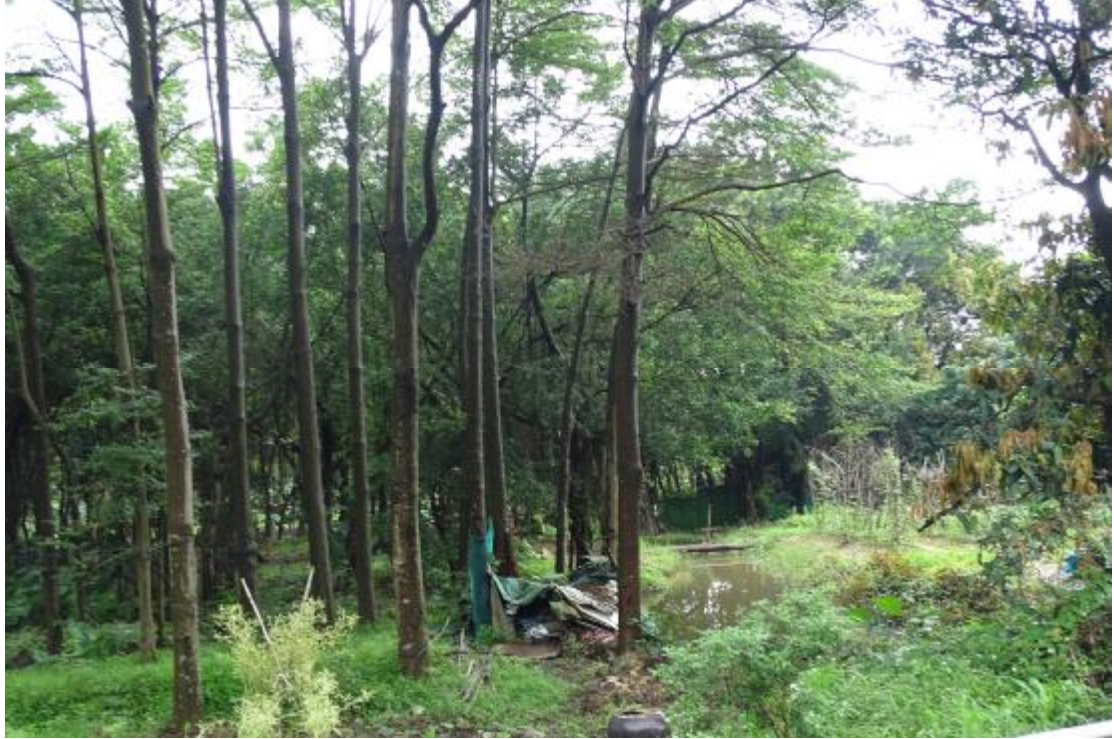
图 14 地块地表现状（南-北）