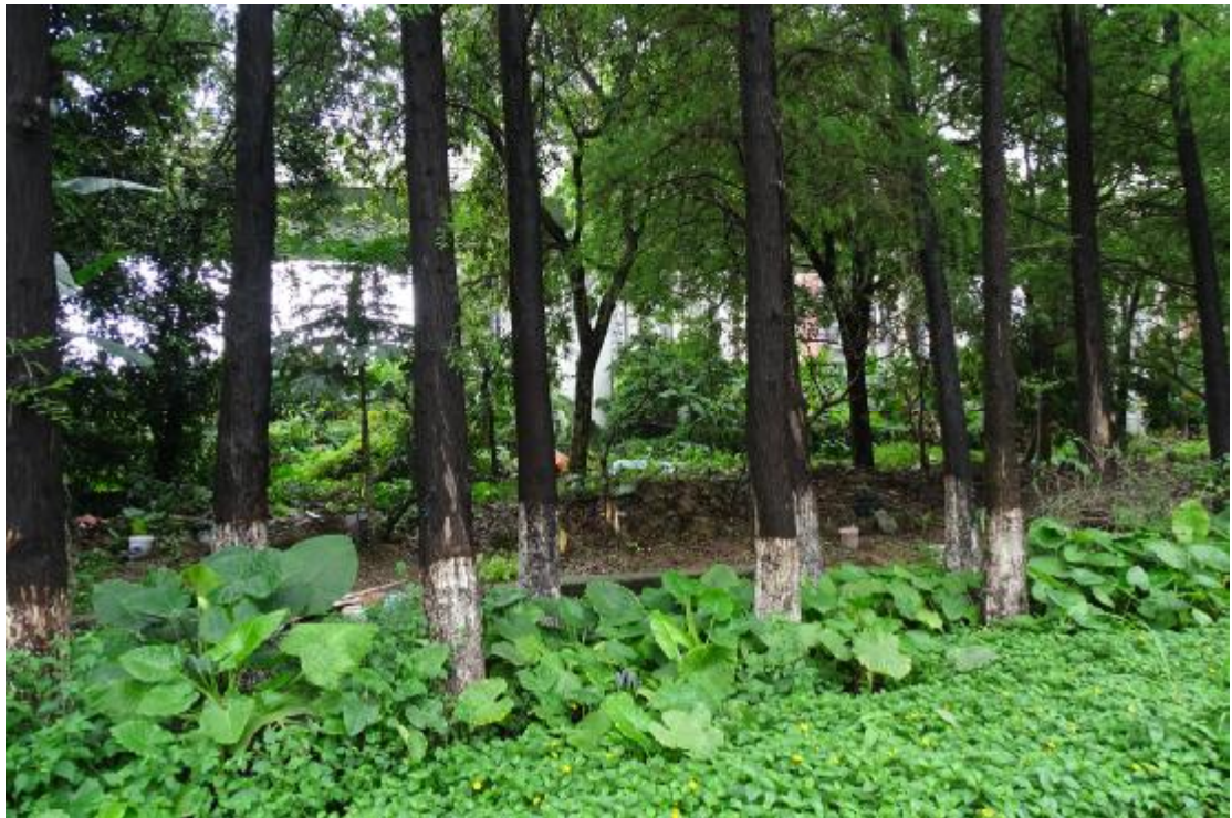
图 29 地块地表现状（西-东）