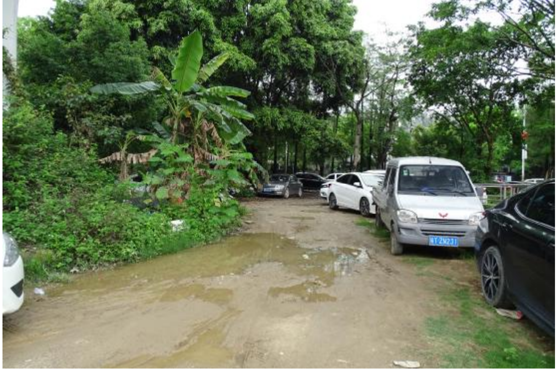
图 26 地块地表现状（东-西）