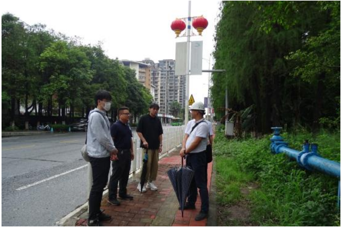
图 4 与现场工作人员确定地块范围（南-北）