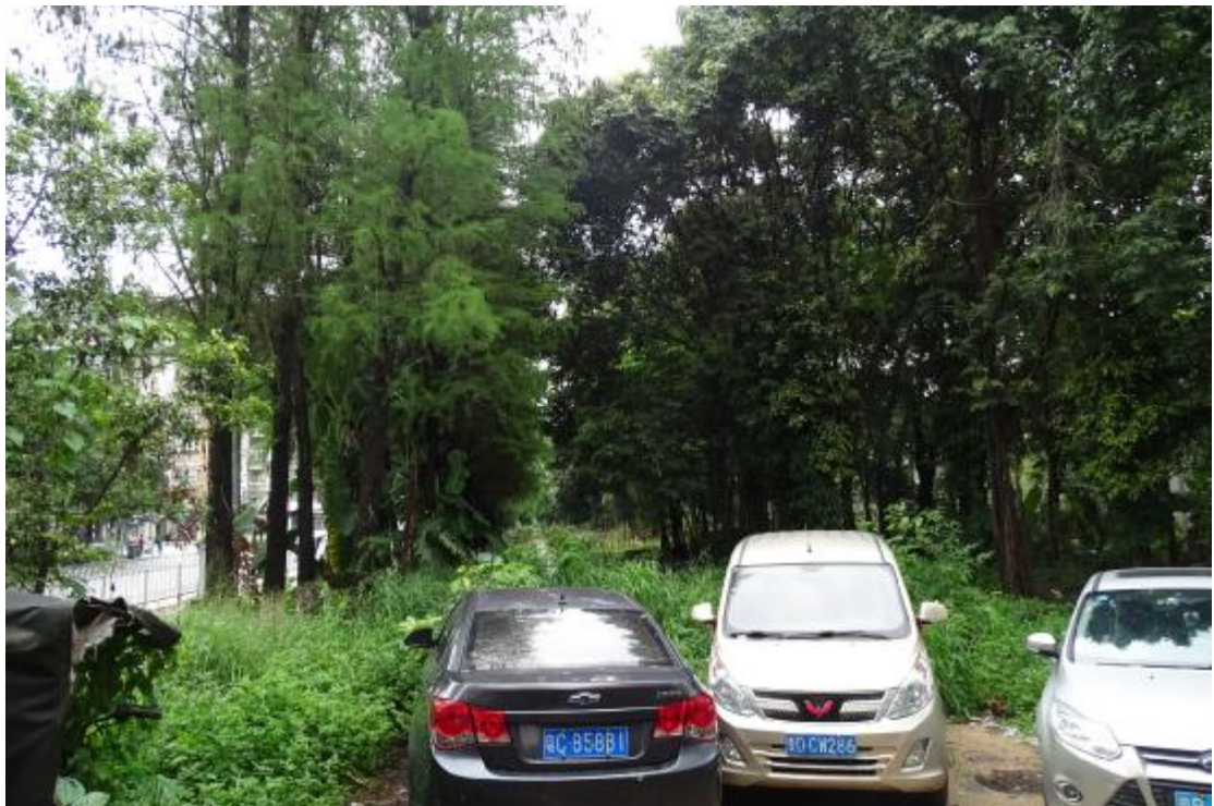
图 7 地块地表现状（南-北）