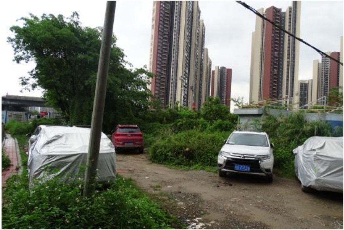
图 12 地块地表现状（西-东）