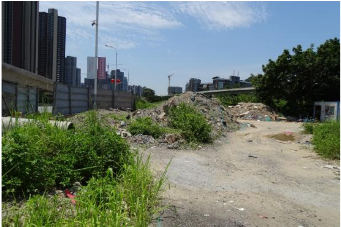
图 21 地块地表现状（北-南）