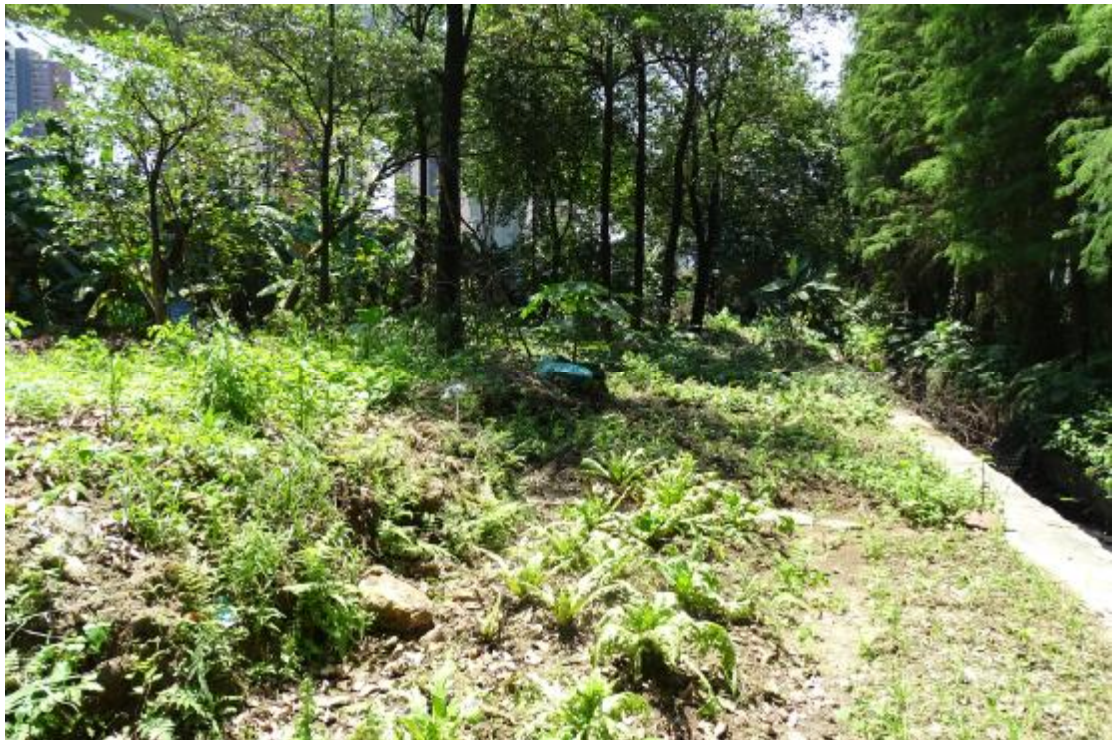
图 31 地块地表现状（北-南）