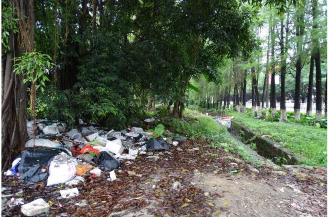
图 28 地块地表现状（北-南）