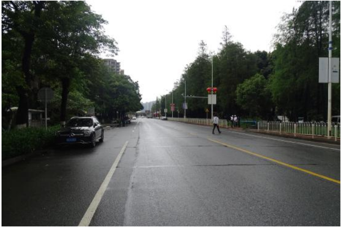
图 6 项目地块外景（南-北）