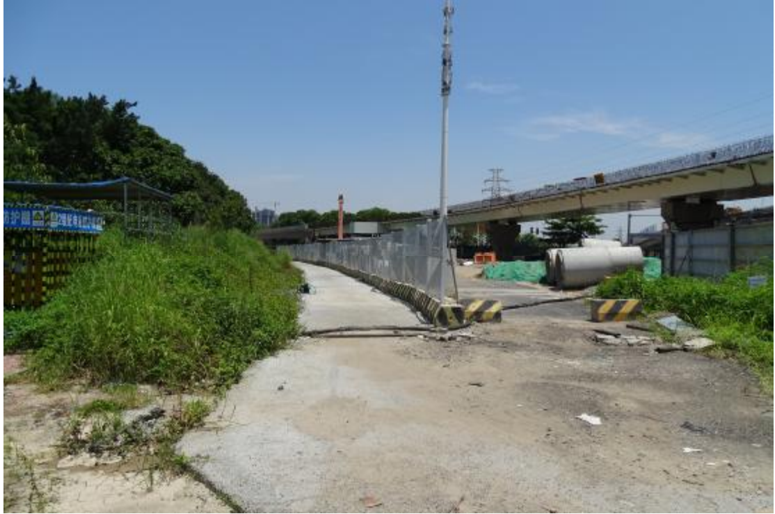
图 20 地块地表现状（南-北）