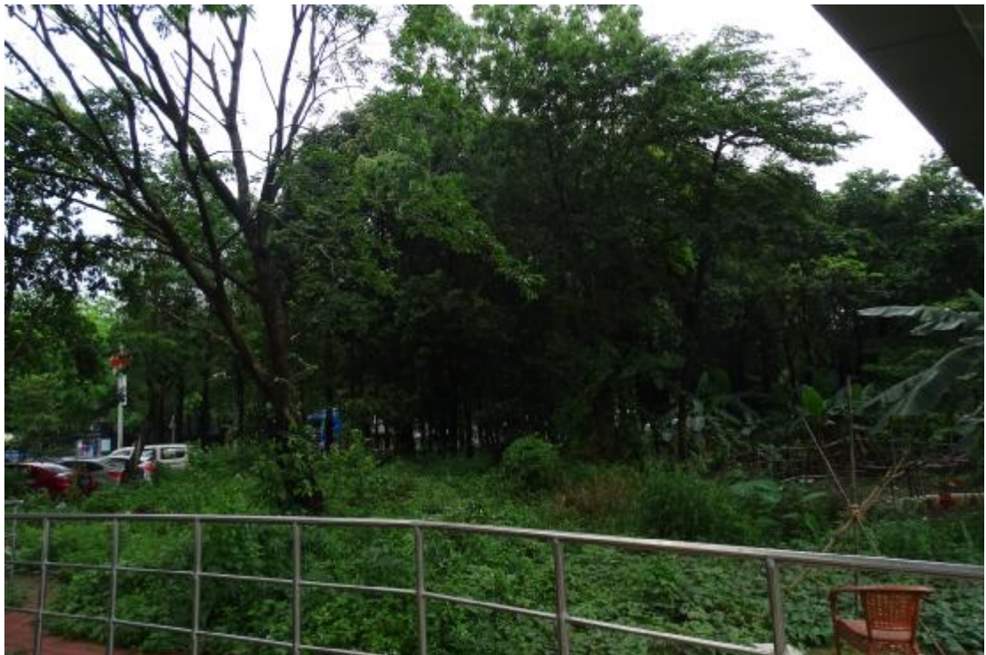
图 11 地块地表现状（南-北）