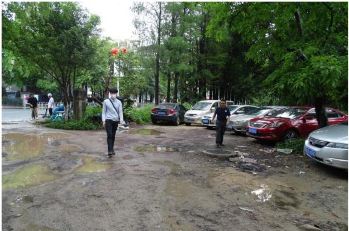
图 5 对地块地表进行踏查（南-北）