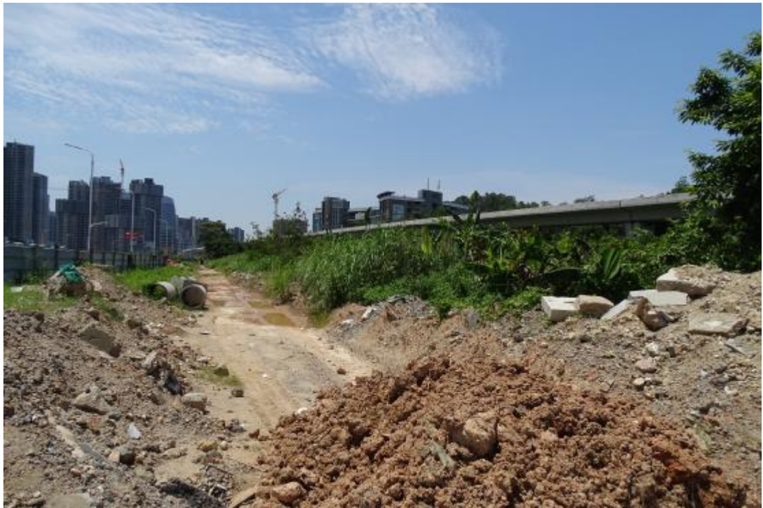
图 33 地块地表现状（北-南）