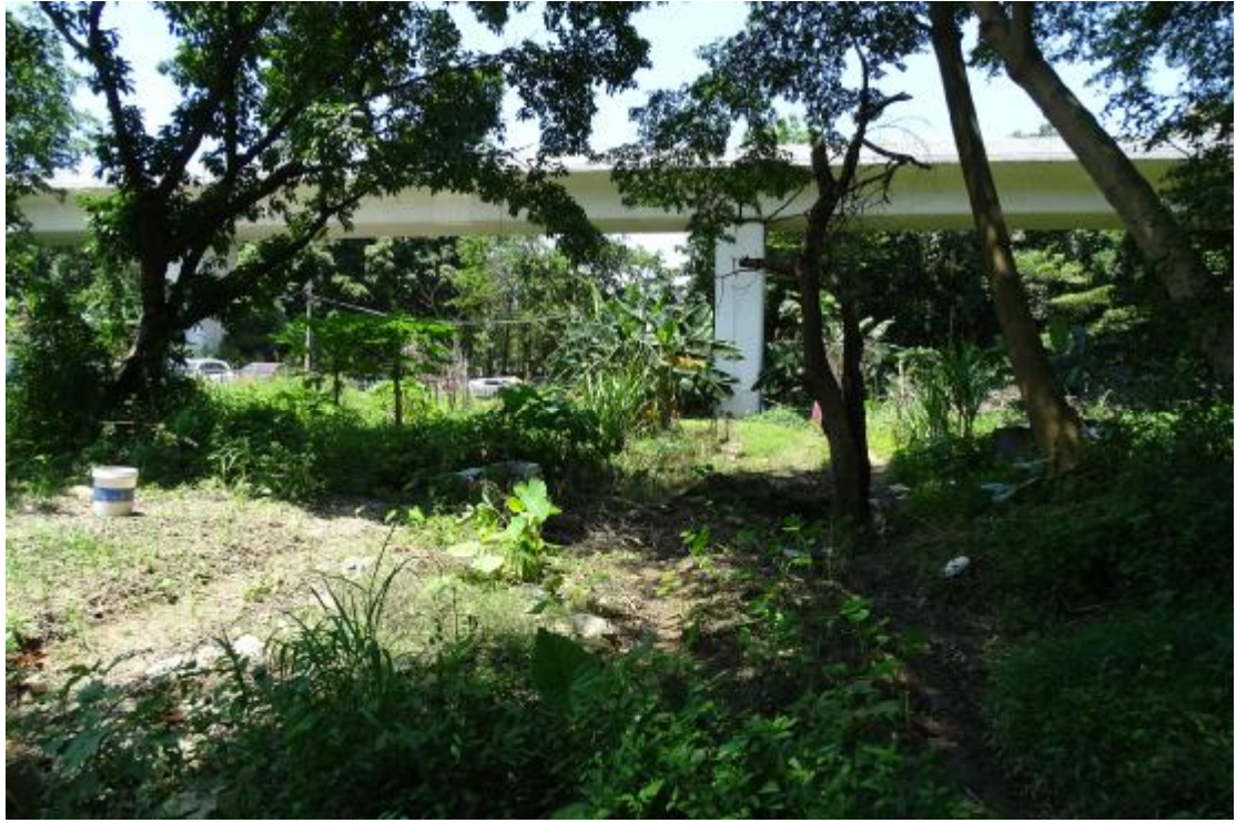
图 24 地块地表现状（东-西）