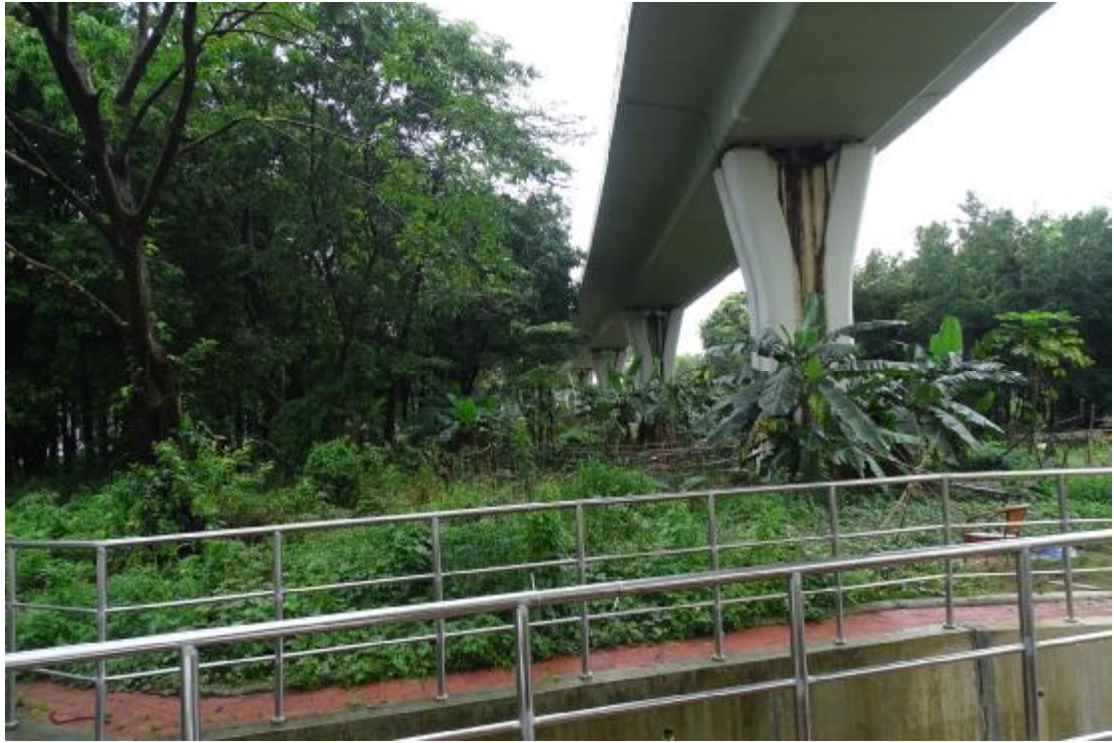
图 10 地块地表现状（南-北）