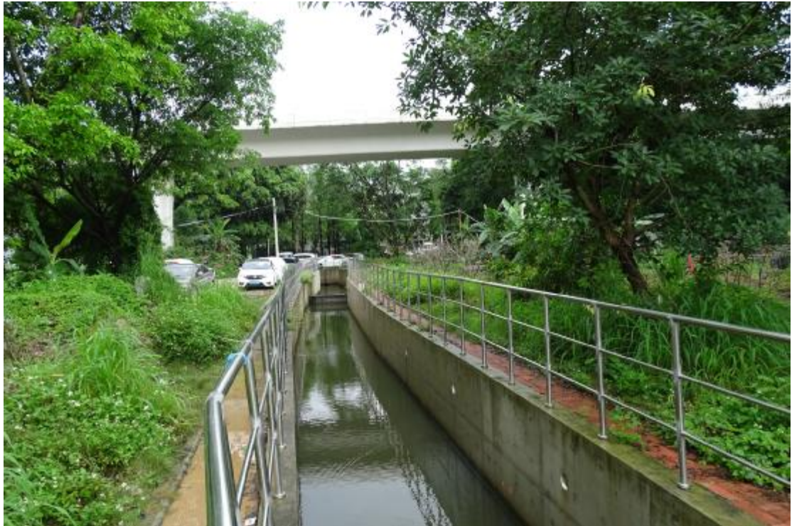
图 25 地块地表现状（东-西）