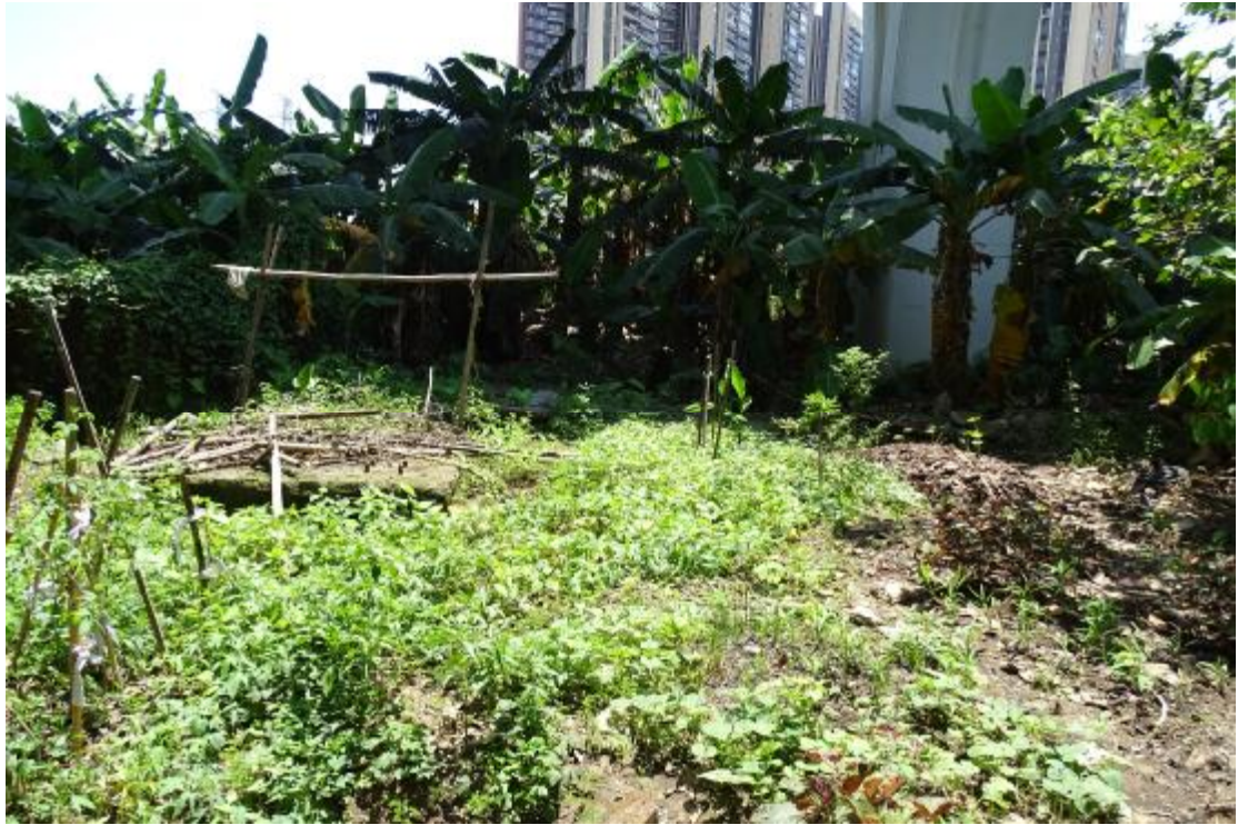
图 32 地块地表现状（西-东）