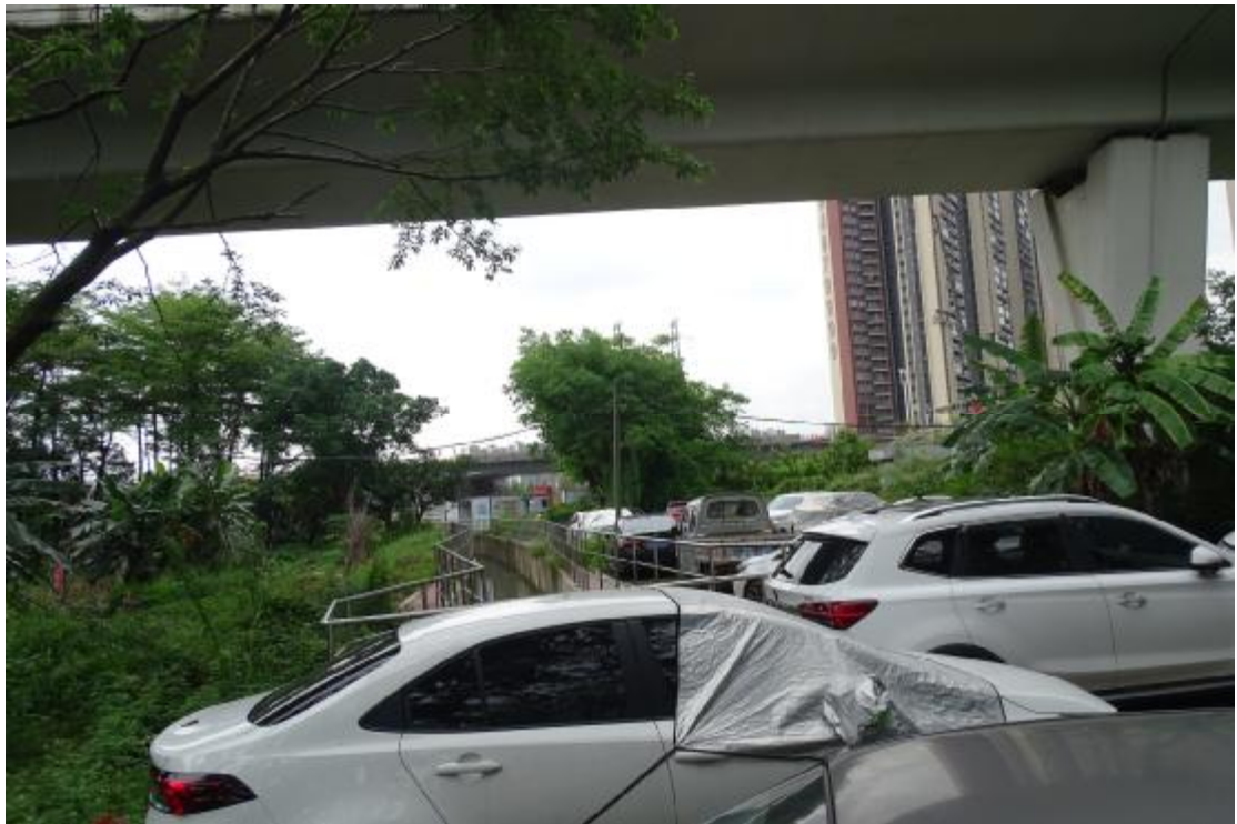
图 9 地块地表现状（西-东）