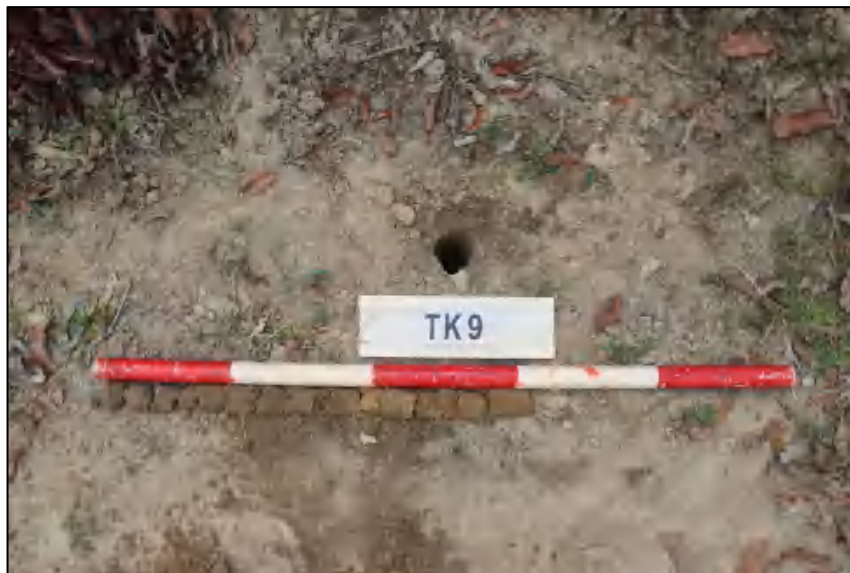
图 24 TK9 土样 (标杆长 1.0 米, 土样由左到右)

①层: 表土层, 距地表 0-0.4 米, 厚约 0.4 米, 灰褐色黏土, 土质疏松, 含有植物根茎、沙粒; ②层: 冲积层, 深 0.4-0.6 米, 厚约 0.2 米, 黄褐色沙土, 土质较疏松, 含大量沙粒。勘探至 1.4 米遇水, 土样无法提取。