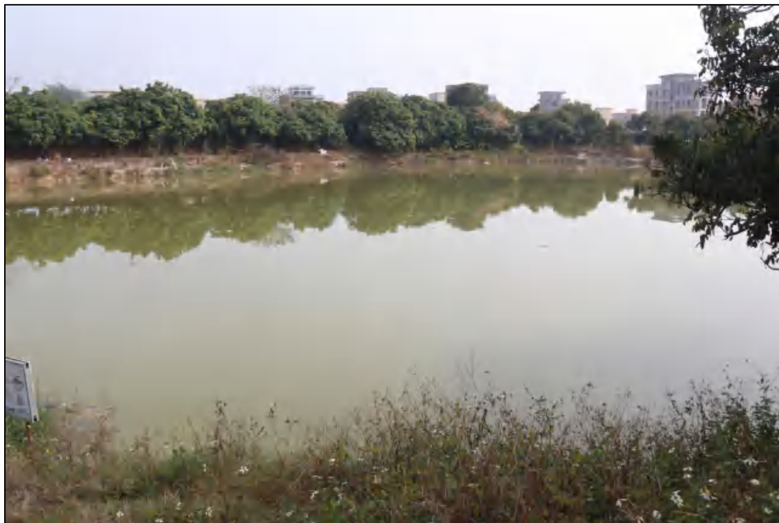
图 8 地块东北部现状（西南-东北）