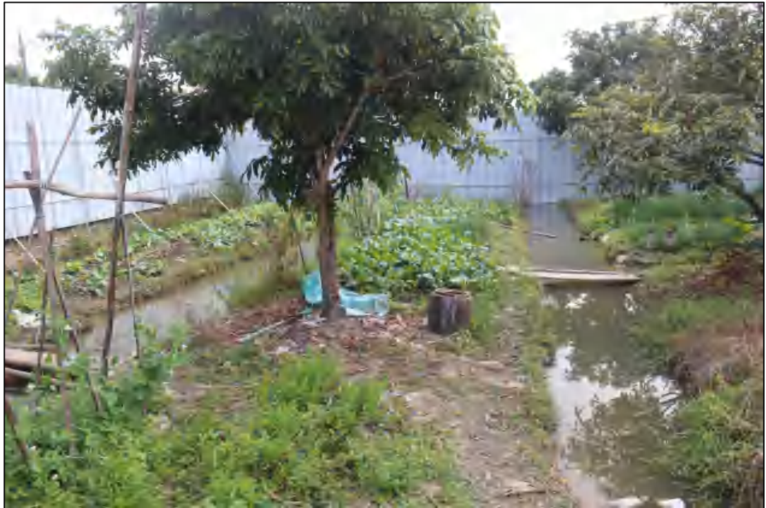
图 11 地块东部现状（西-东）