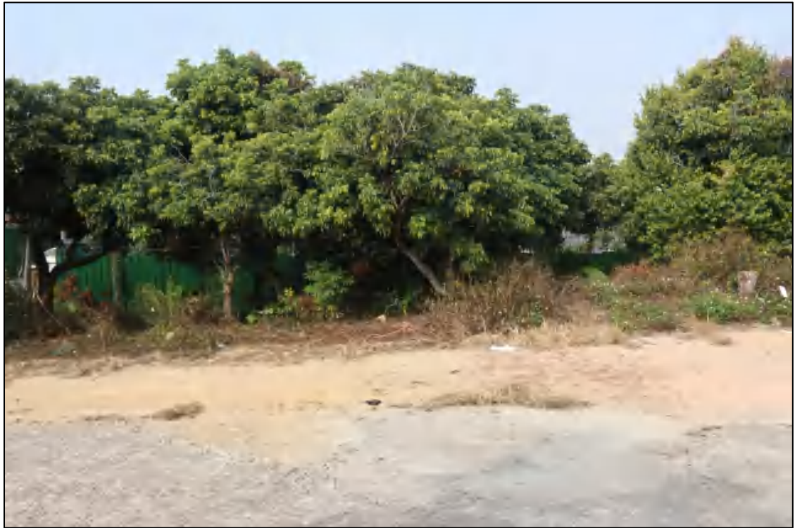
图 13 地块中部现状（北-南）