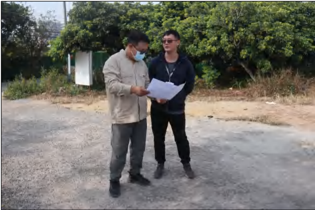
图 5 考古工作人员现场查看图纸（东北-西南）