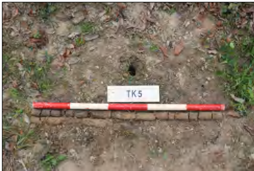
图 20 TK5 土样 (标杆长 1.0 米,土样由左上到右下)

①层: 表土层,深 0-0.4 米,厚 0.4 米,灰褐色黏土,土质疏松,含有植物根茎、沙粒;②层: 冲积层,深 0.4-1.4 米,厚约 1.0 米,黄褐色沙土,土质较疏松,含大量沙粒,含水量较大。勘探至 1.4 米遇水,土样无法提取。