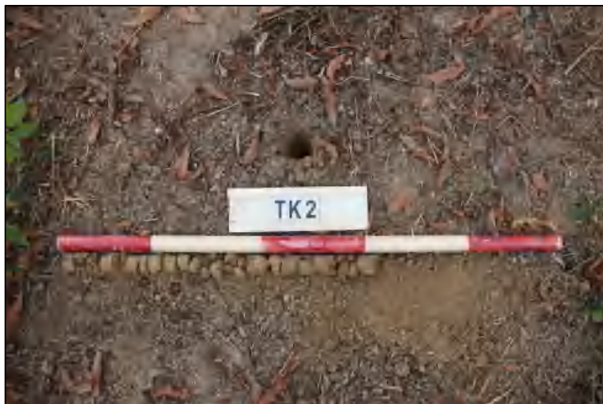
图 17 TK2 土样 (标杆长 1.0 米,土样由左到右)

①层: 表土层,距地表 0-0.6 米,厚约 0.6 米,灰黄褐色相间黏土,土质疏松,含有植物根茎、沙粒。勘探至 0.6 米遇石块,土样无法提取。