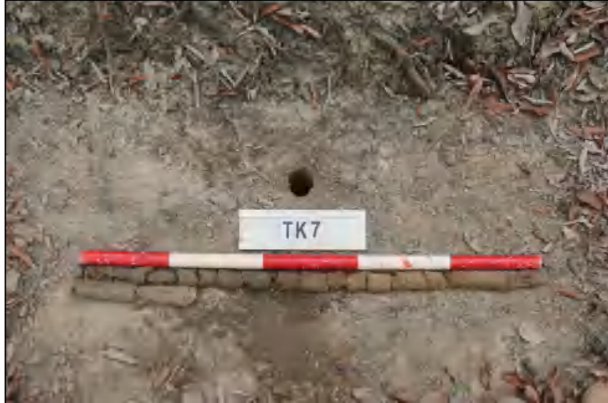
图 22 TK7 土样 (标杆长 1.0 米, 土样由左上到右下)

①层: 表土层, 距地表 0-0.4 米, 厚约 0.4 米, 灰褐色黏土, 土质疏松, 含有植物根茎、沙粒; ②层: 冲积层, 深 0.4-1.3 米, 厚约 0.9 米, 黄褐色沙土, 土质较疏松, 含大量沙粒, 含水量较大。勘探至 1.3 米遇水, 土样无法提取。