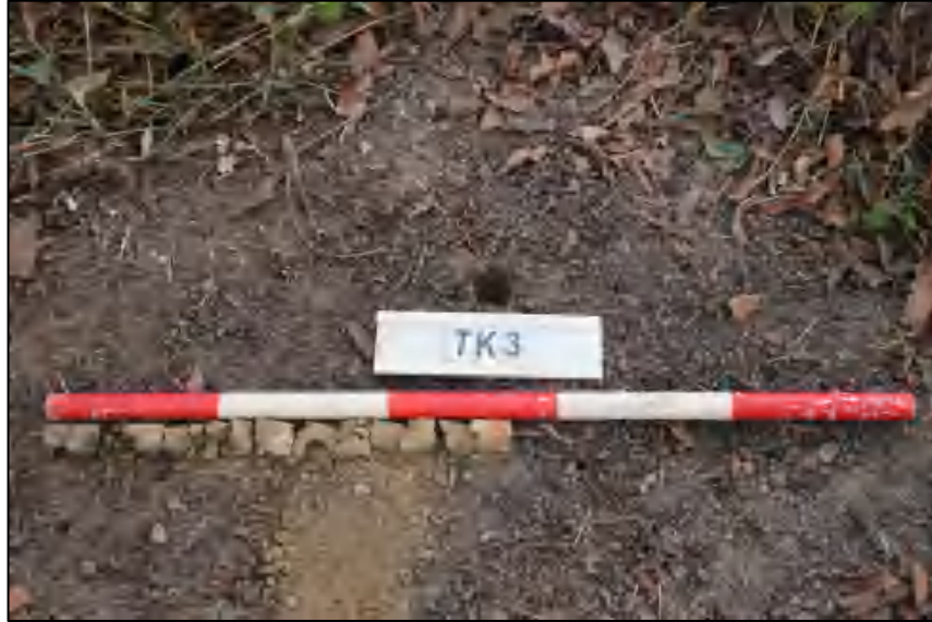
图 18 TK3 土样 (标杆长 1.0 米,土样由左到右)

①层: 表土层,距地表 0-0.55 米,厚约 0.55 米,土色杂乱,土质疏松,含有植物根茎、沙粒。勘探至 0.55 米遇石块,土样无法提取。