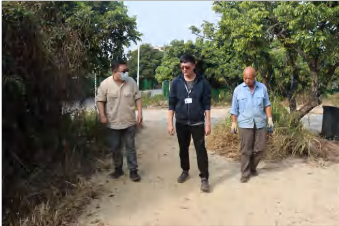
图 6 考古工作人员现场踏查（东-西）