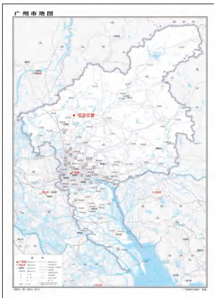
图 1 项目地块在广州市位置（广东省国土资源厅）

根据《中华人民共和国文物保护法》《广州市文物保护规定》，按照《广州市文物局关于花都区铜鼓坑以东片区做地项目（启动区）考古调查勘探工作的复函》（文物 20231577 号）指导意见，受广州花都城市建设投资集团有限公司委托，由我院负责该项目的文物考古调查工作。