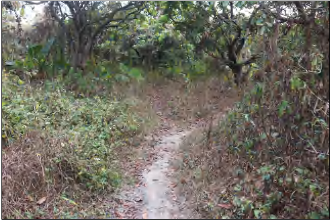
图 10 地块东部现状（西-东）