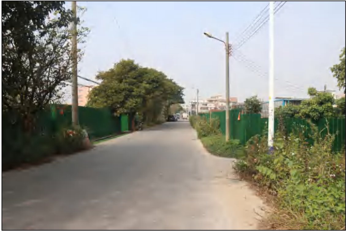
图 12 地块西部现状（东-西）