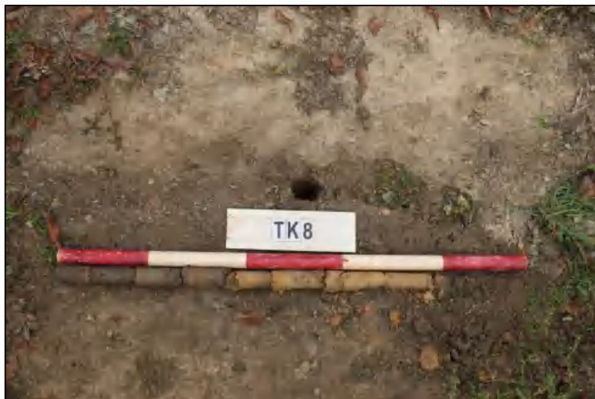
图 23 TK8 土样 (标杆长 1.0 米, 土样由左到右)

①层: 表土层, 距地表 0-0.4 米, 厚约 0.4 米, 灰褐色黏土, 土质疏松, 含有植物根茎、沙粒; ②层: 冲积层, 深 0.4-0.8 米, 厚约 0.4 米, 黄褐色沙土, 土质较疏松, 含大量沙粒。勘探至 0.8 米遇水, 土样无法提取。