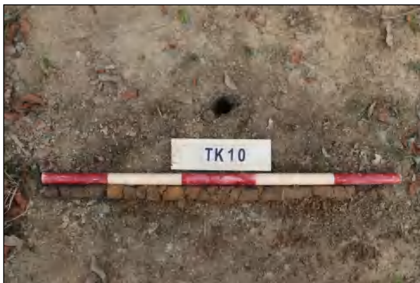
图 25 TK10 土样 (标杆长 1.0 米, 土样由左到右)

①层: 表土层, 距地表 0-0.2 米, 厚约 0.2 米, 灰褐色黏土, 土质疏松, 含有植物根茎、沙粒; ②层: 冲积层, 深 0.2-0.85 米, 厚约 0.65 米, 黄褐色沙土, 土质较疏松, 含大量沙粒。勘探至 0.85 米遇水, 土样无法提取。