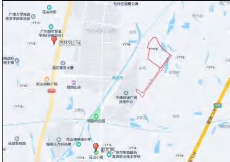
图 4 项目地块周边不可移动文物分布示意图（腾讯地图）

根据《广州市文物普查汇编·花都区卷》所收录，该地块内的文物资源有 2 处：秀林刘公祠、静观庐。