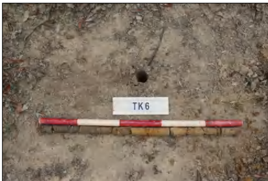
图 21 TK6 土样 (标杆长 1.0 米,土样由左到右)

①层: 表土层,深 0-0.3 米,厚约 0.3 米,灰褐色黏土,土质疏松,含有植物根茎、沙粒。②层: 冲积层,深 0.3-1.0 米,厚约 0.7 米,黄褐色沙土,土质较疏松,含大量沙粒。勘探至 1.0 米遇水,土样无法提取。