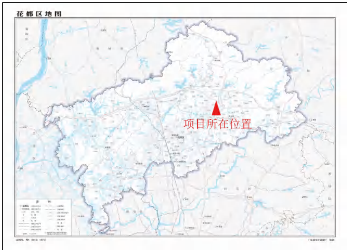
图 2 项目地块在花都区位置（广东省国土资源厅）