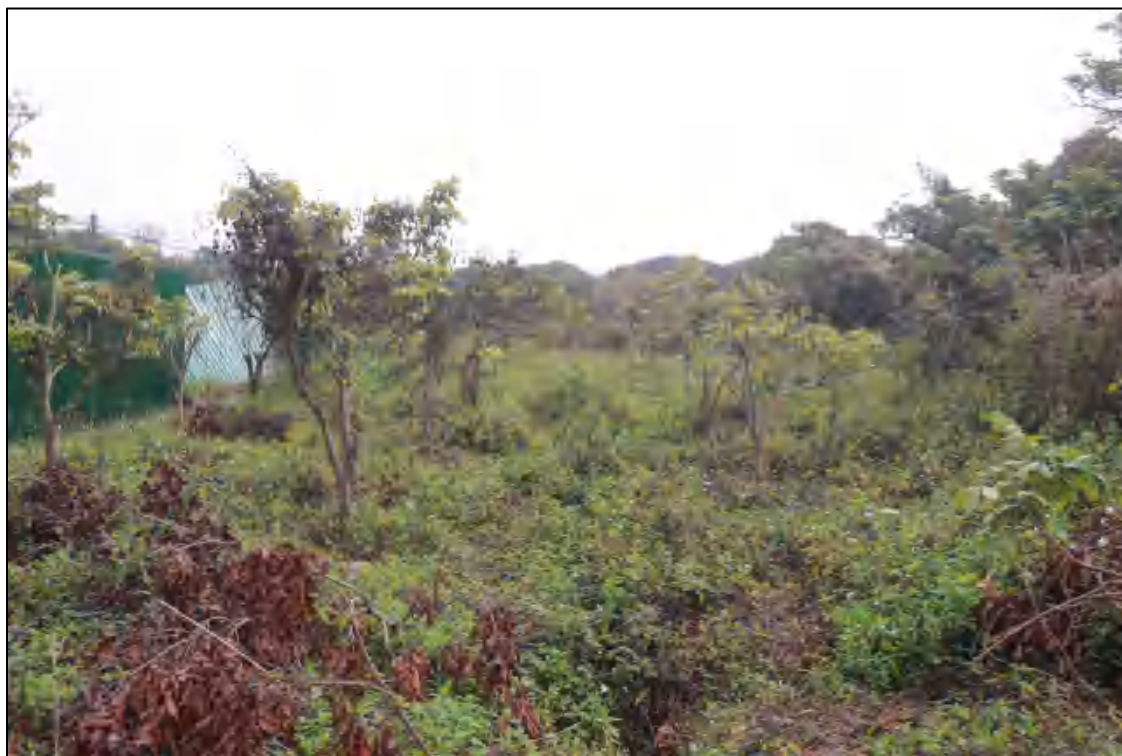
图 9 地块东部现状（西-东）