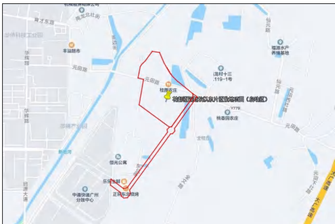
图 3 项目地块周边位置图