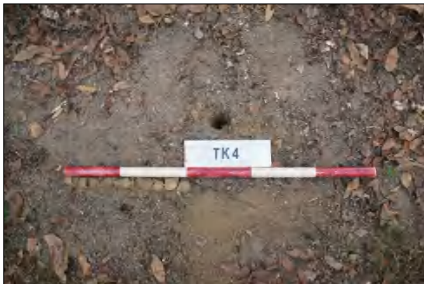
图 19 TK4 土样 (标杆长 1.0 米,土样由左到右)

①层: 表土层,距地表 0-0.4 米,厚约 0.4 米,灰黄褐色相间黏土,土质疏松,含有植物根茎、沙粒。勘探至 0.4 米遇石块,土样无法提取。