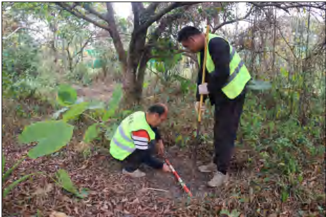
图 15 试探孔提取工作照（东南-西北）