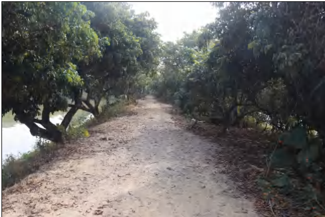
图 7 地块东北部现状（西-东）