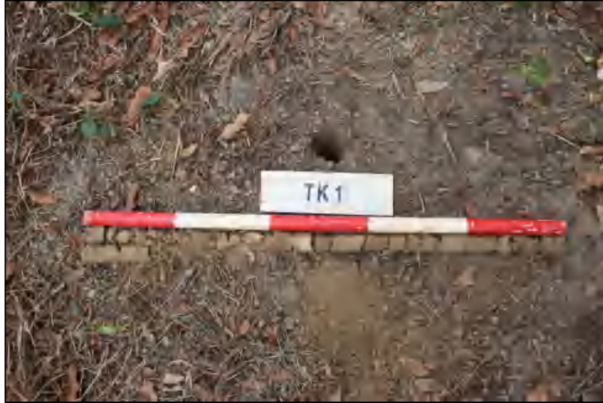
图 16 TK1 土样 (标杆长 1.0 米,土样由左上到右下)

①层: 表土层,距地表 0-1.2 米,厚约 1.2 米,灰黄褐色相间黏土,土质疏松,含有植物根茎、沙粒。勘探至 1.2 米遇石块,土样无法提取。