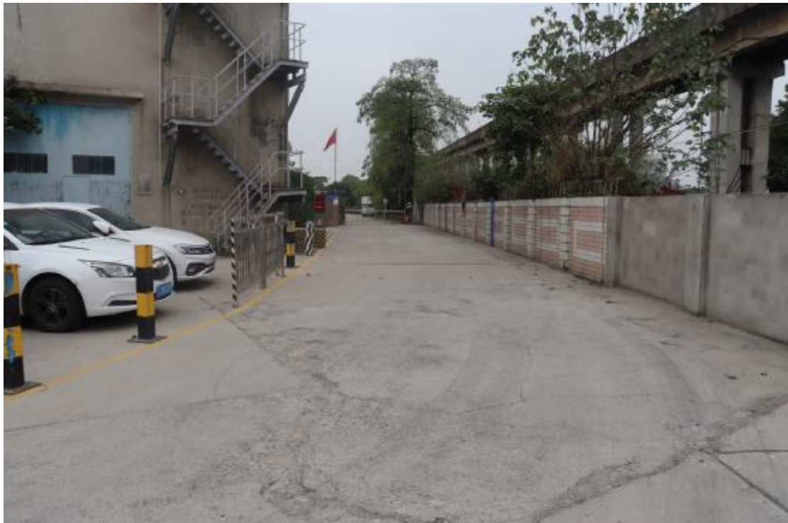
图 11 地块内现状（东南-西北）