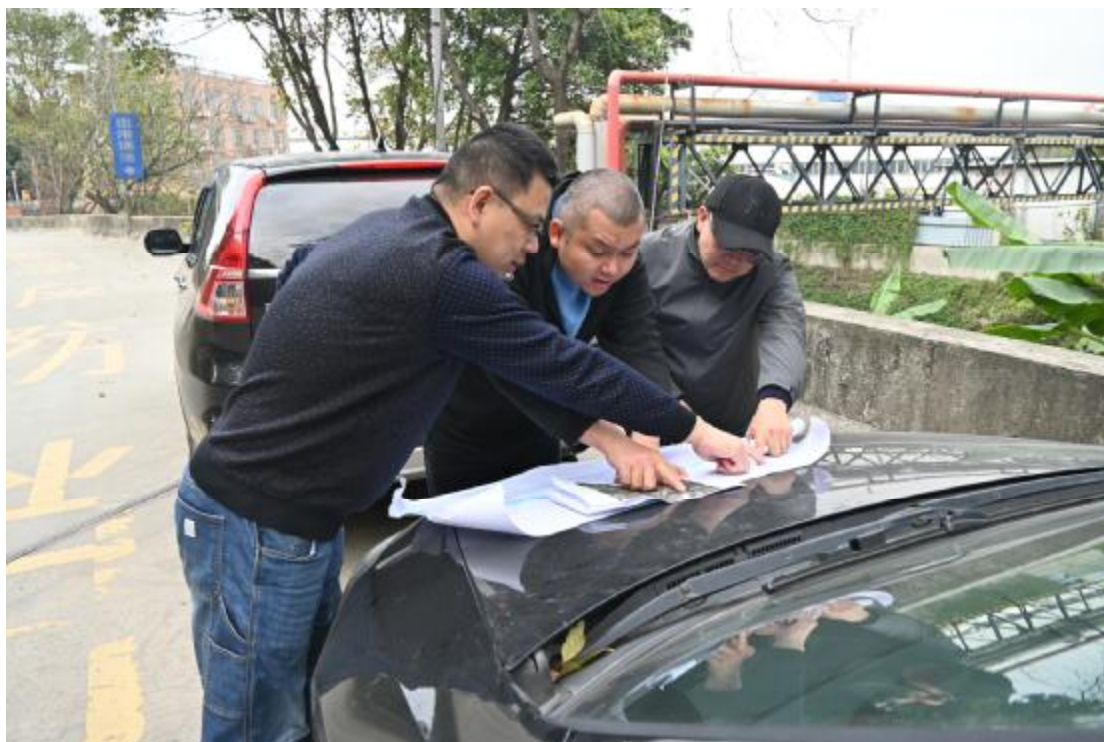
图 5 工作人员确认地块范围（东北-西南）