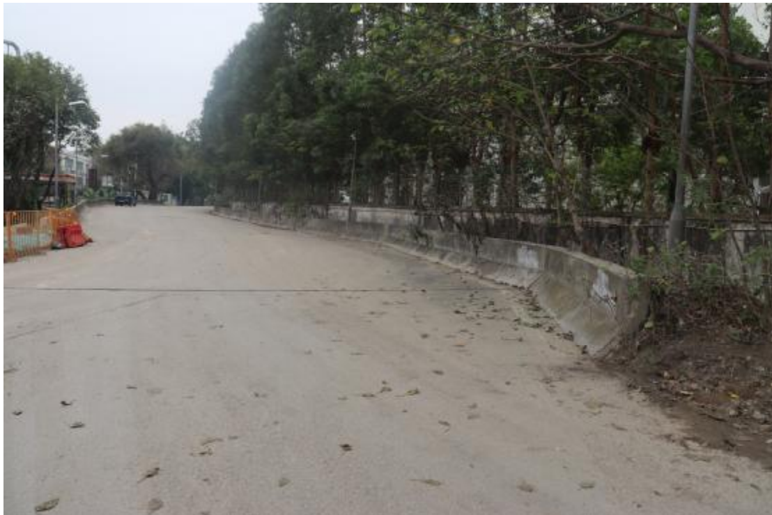
图 13 地块内现状（东-西）