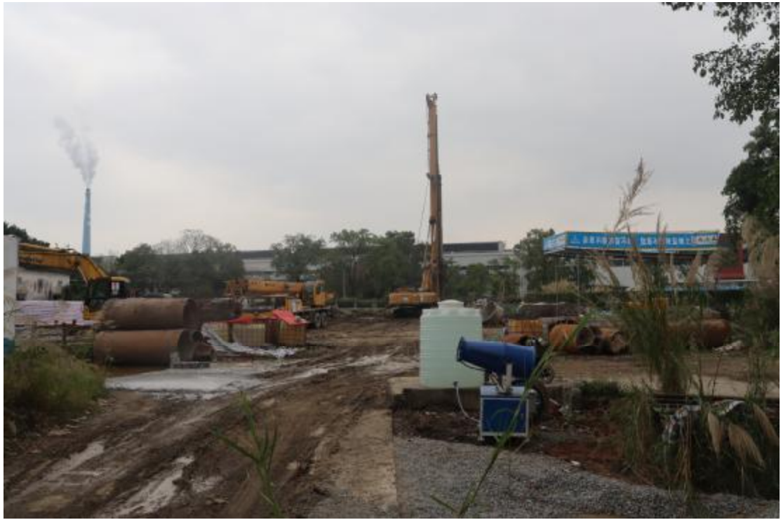
图 14 地块内现状（南-北）