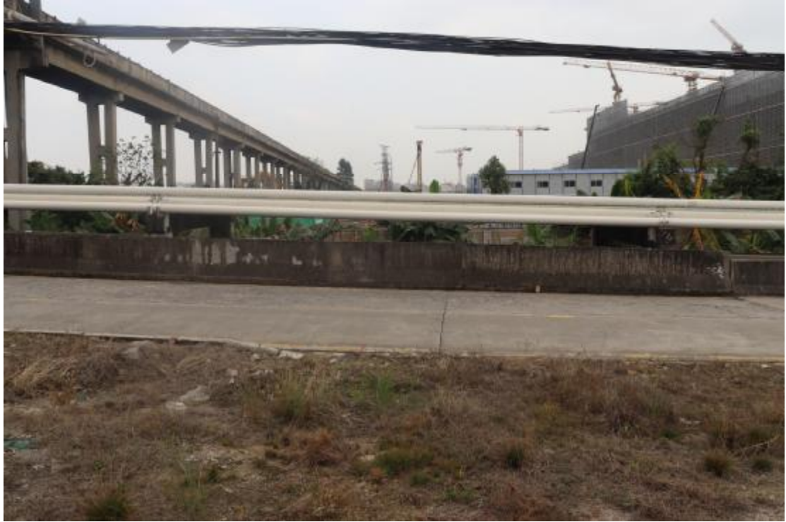
图 8 地块内现状（东-西）