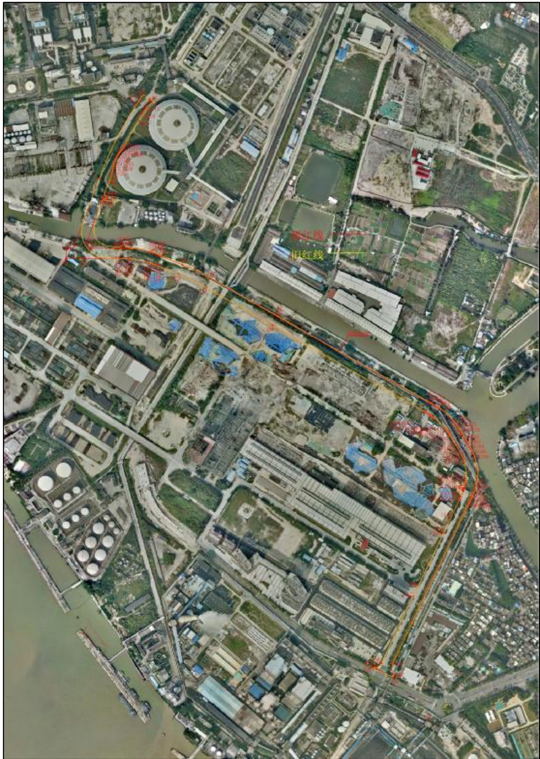
图 4 项目卫星红线图