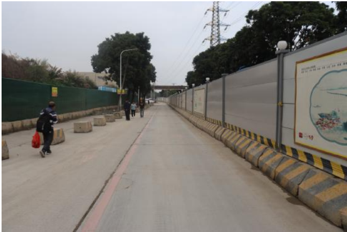
图 16 地块内现状（西南-东北）