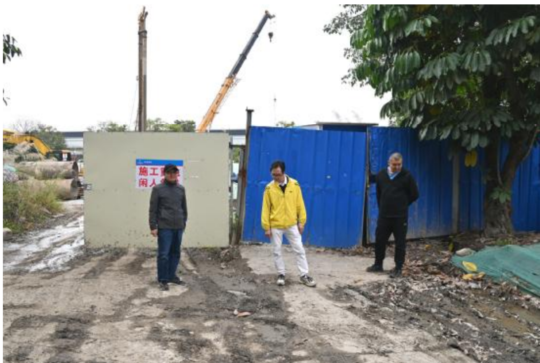
图 6 现场踏查（北-南）