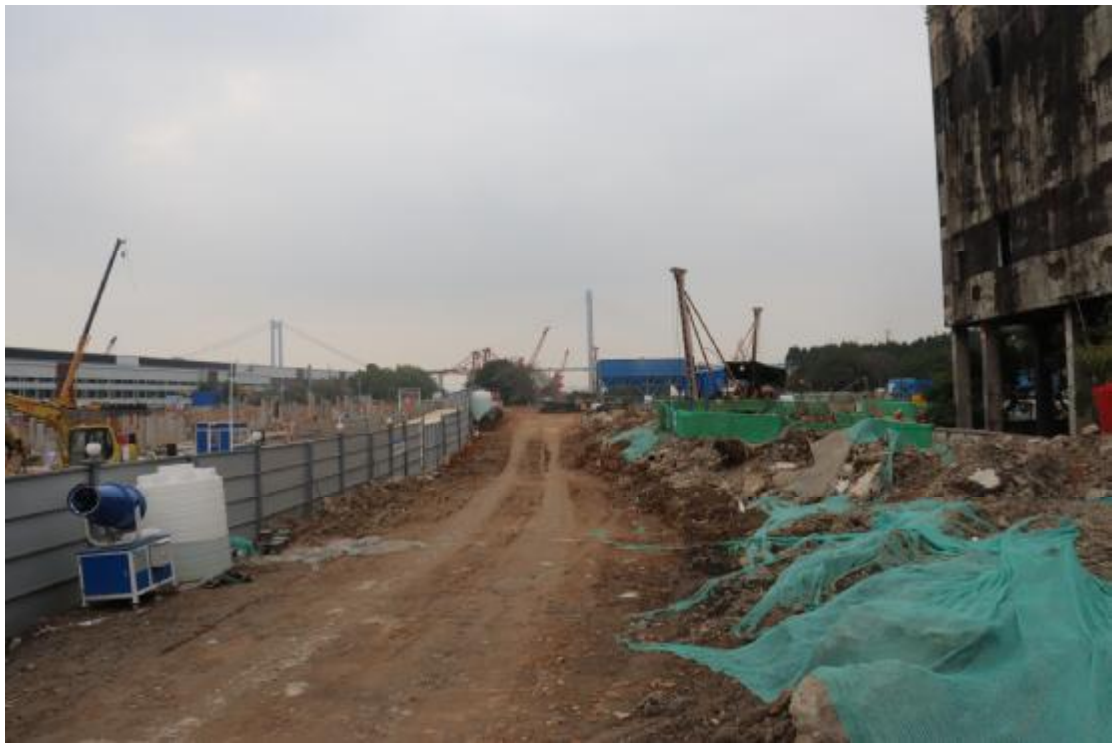
图 9 地块内现状（东-西）