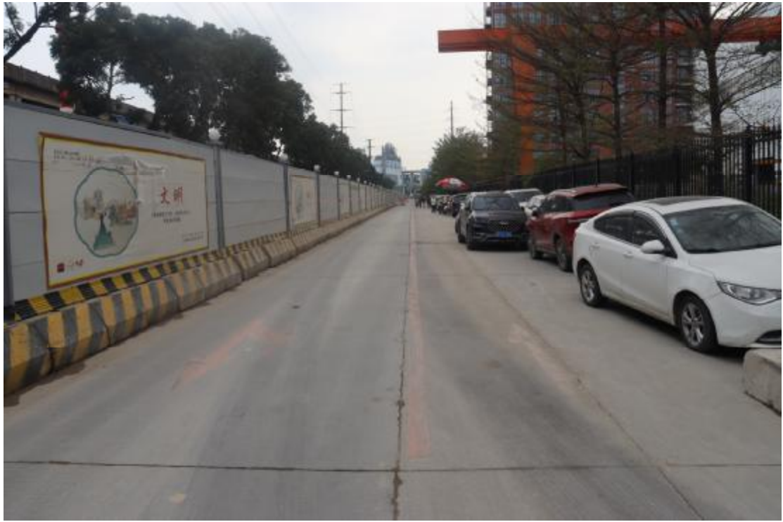
图 10 地块内现状（东北-西南）