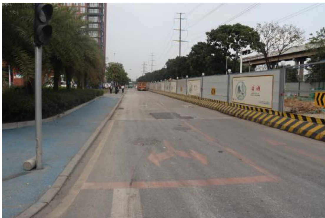
图 7 地块内现状（西南-东北）