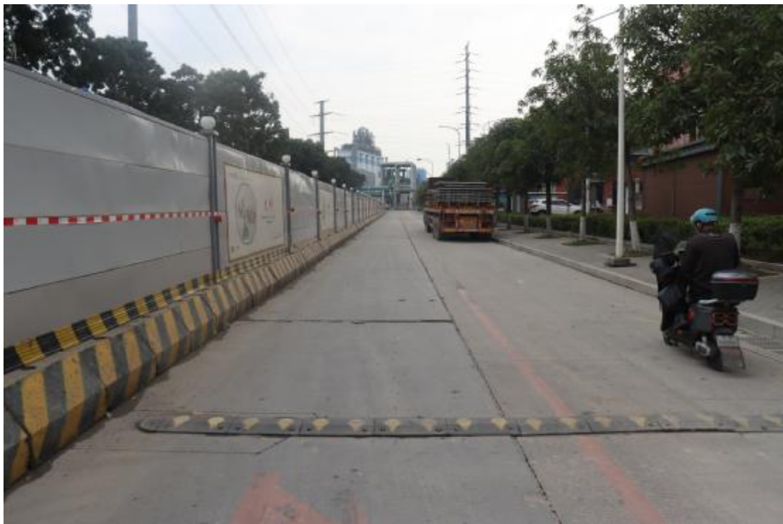
图 17 地块内现状（西南-东北）