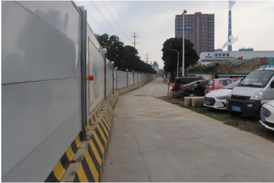
图 12 地块内现状（东-西）