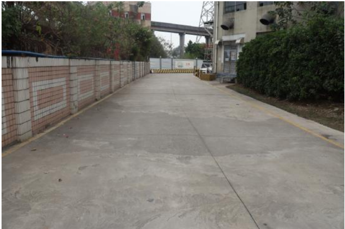
图 15 地块内现状（西北-东南）