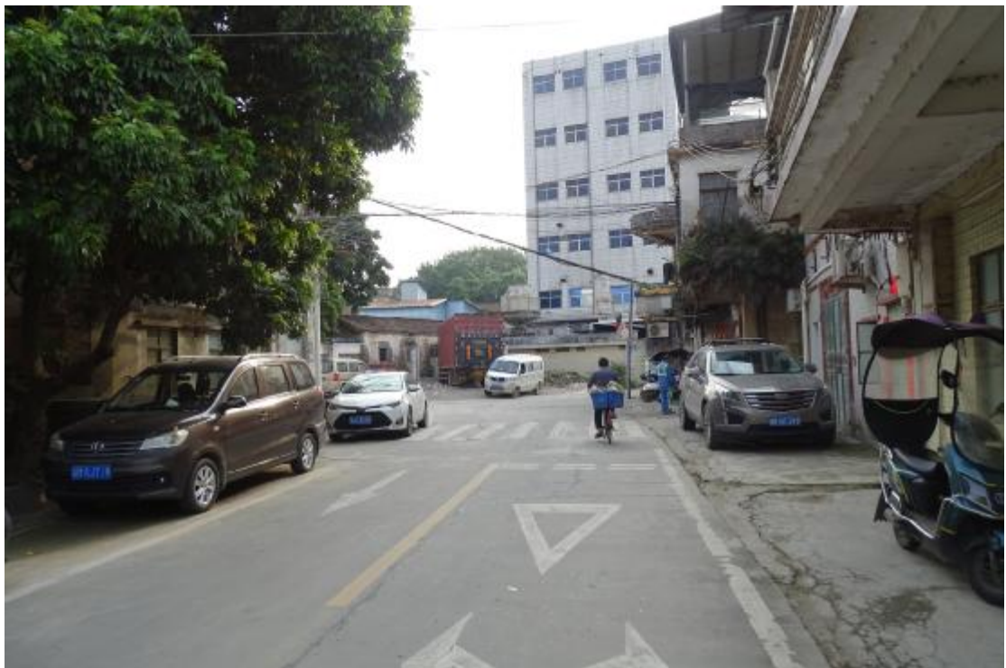
图 21 工程用地北部地表现状（西-东）