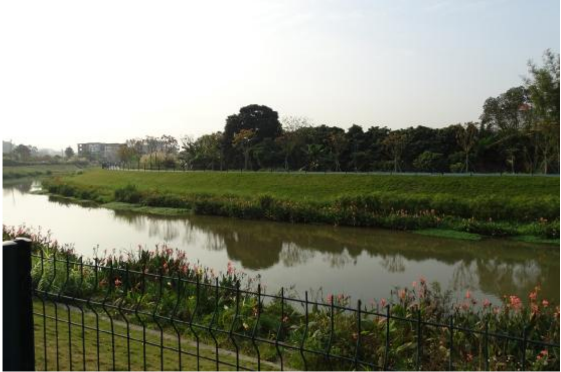
图 26 工程用地南部地表现状（北-南）