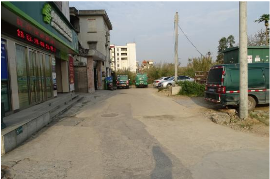
图 15 工程用地北部地表现状（东-西）