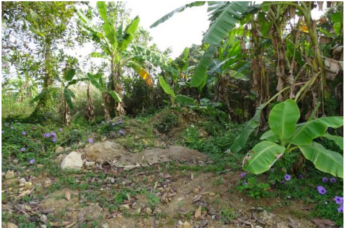
图 31 工程用地南部地表现状（西-东）