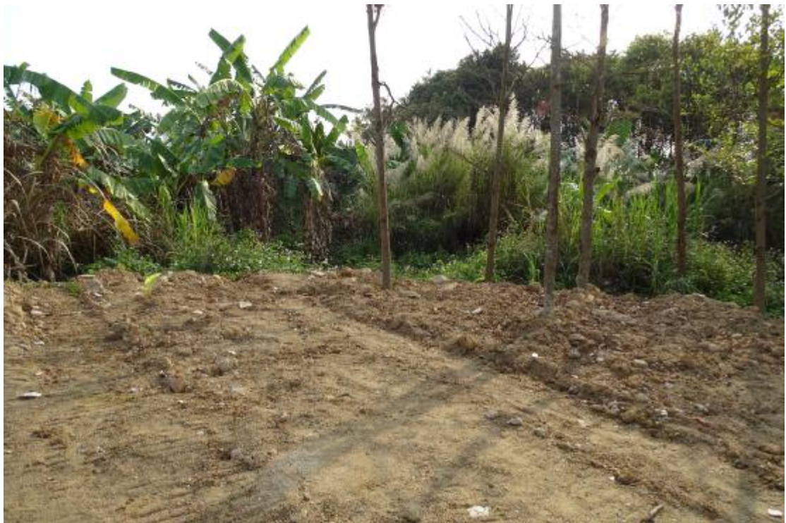
图 33 工程用地南部地表现状（南-北）