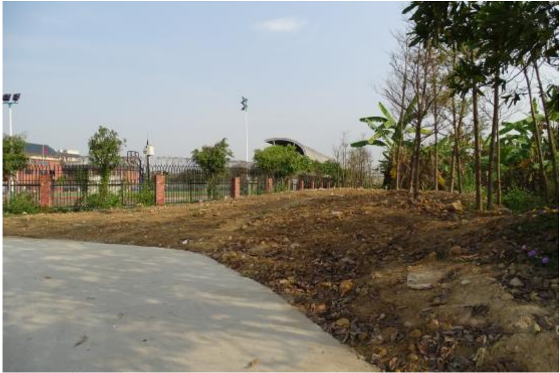
图 32 工程用地南部地表现状（南-北）