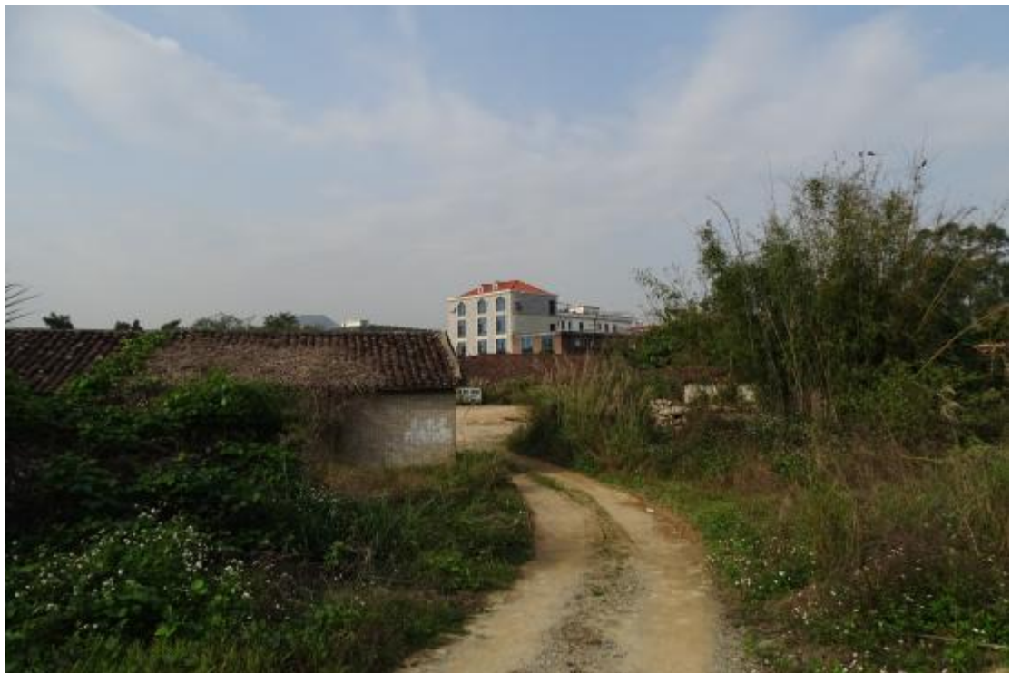
图 43 工程用地南部地表现状（东-西）