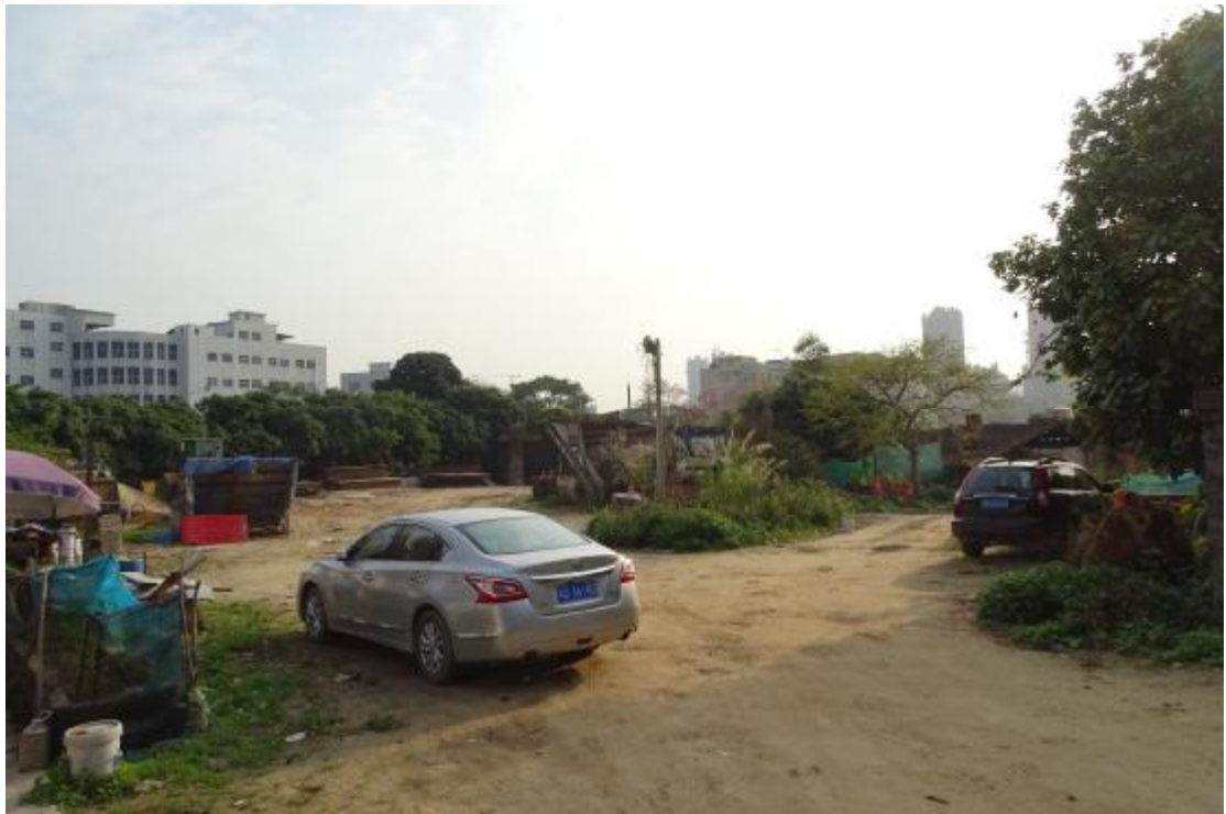
图 27 工程用地南部地表现状（北-南）