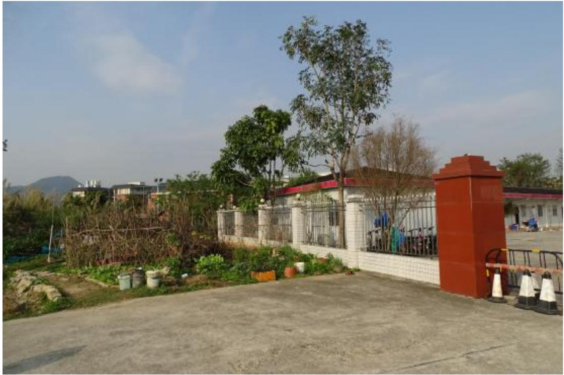
图 40 工程用地南部地表现状（北-南）