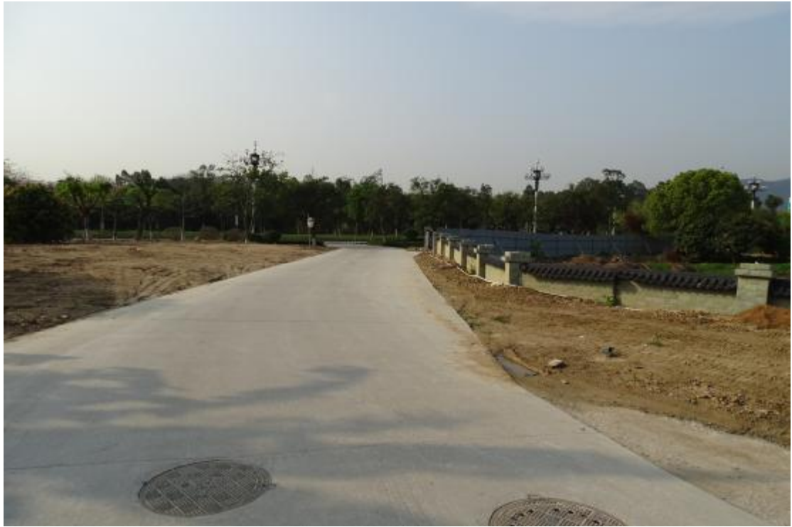
图 28 工程用地南部地表现状（北-南）