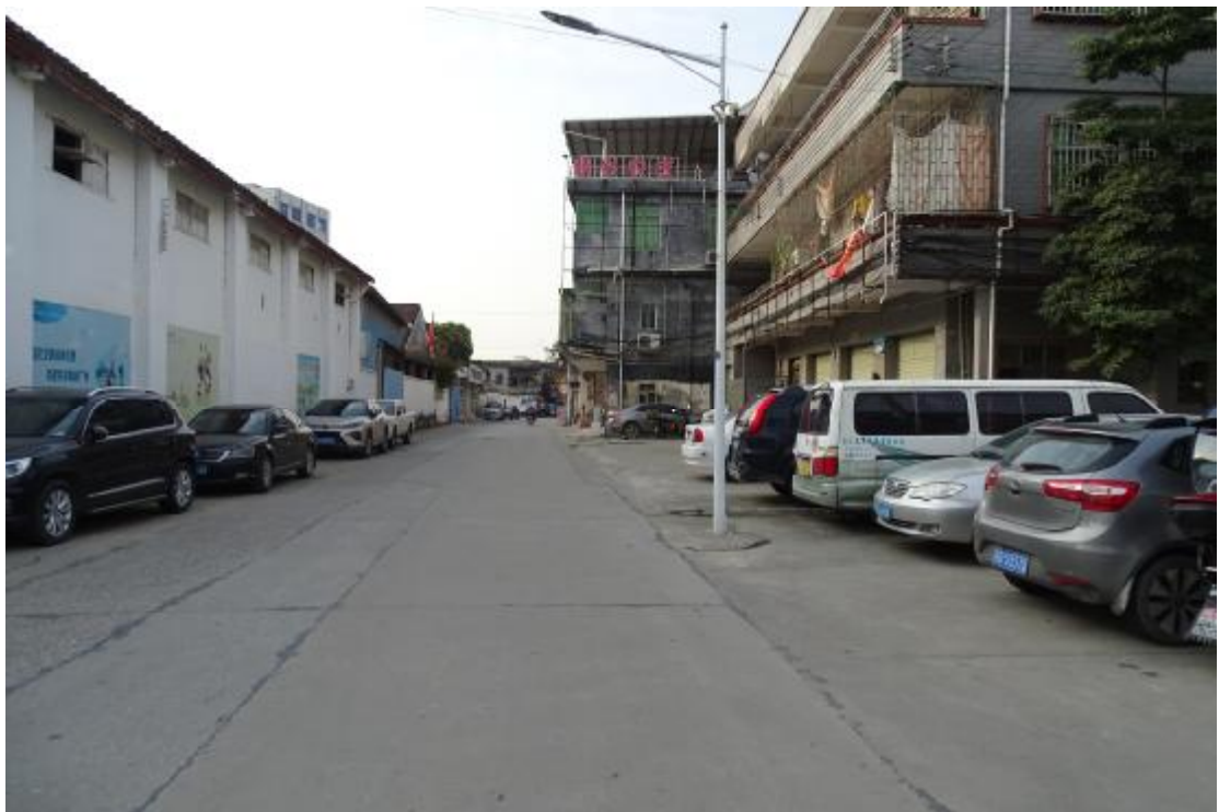
图 19 工程用地北部地表现状（北-南）