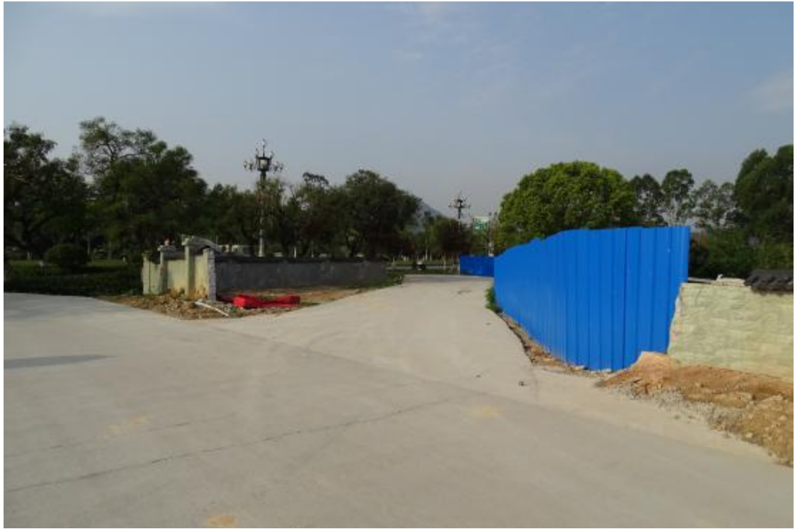
图 36 工程用地南部地表现状（北-南）