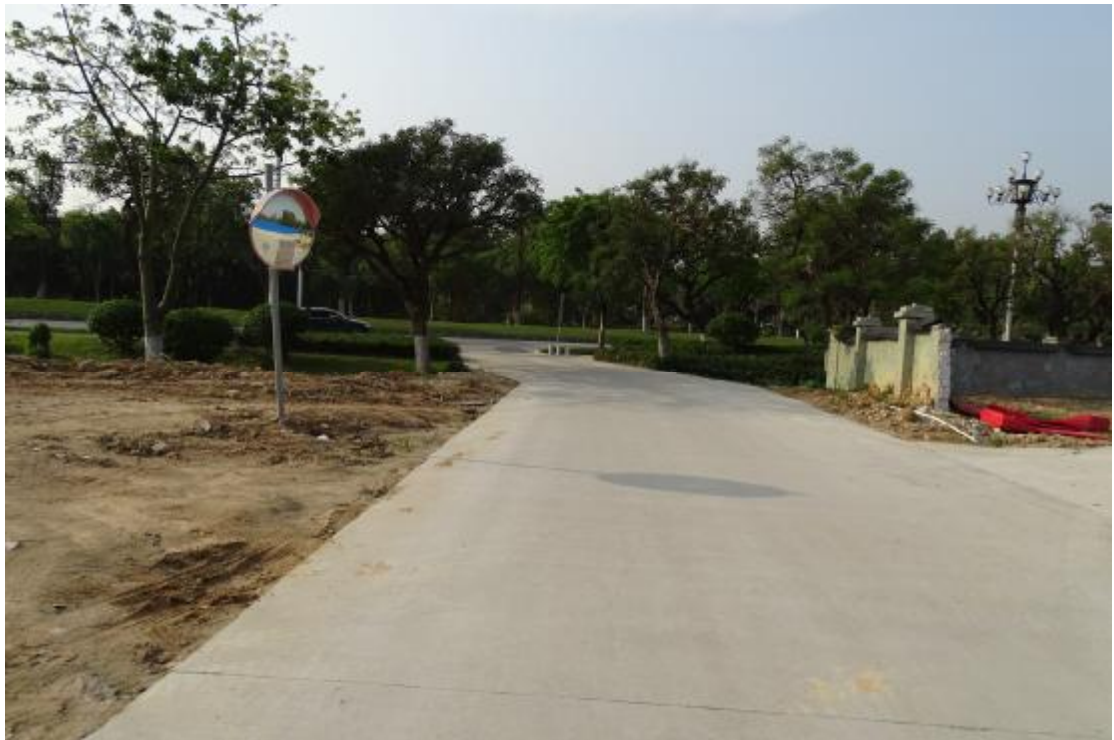
图 37 工程用地南部地表现状（北-南）