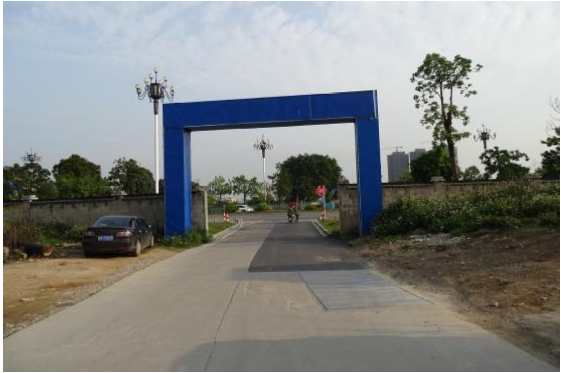
图 14 工程用地北部地表现状（南-北）