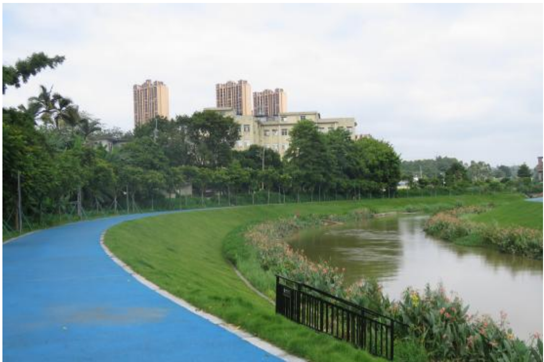
图 47 工程用地南部地表现状（西-东）