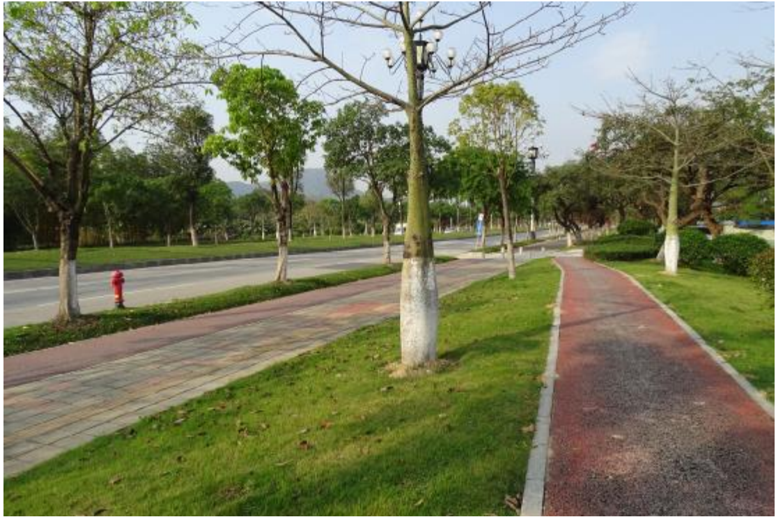
图 38 工程用地南部地表现状（北-南）