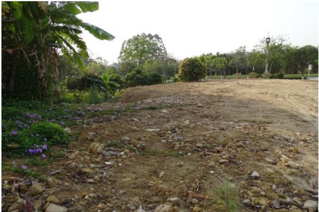
图 29 工程用地南部地表现状（北-南）