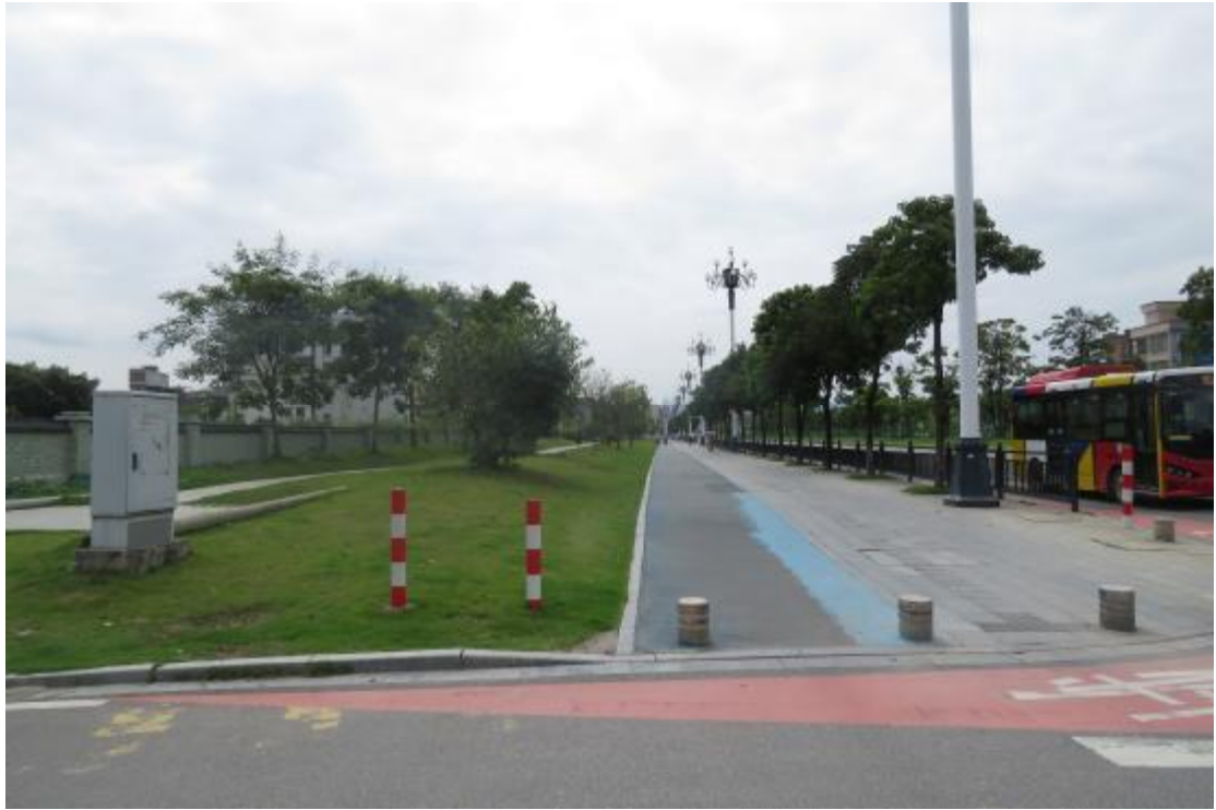
图 12 工程用地北部地表现状（东-西）