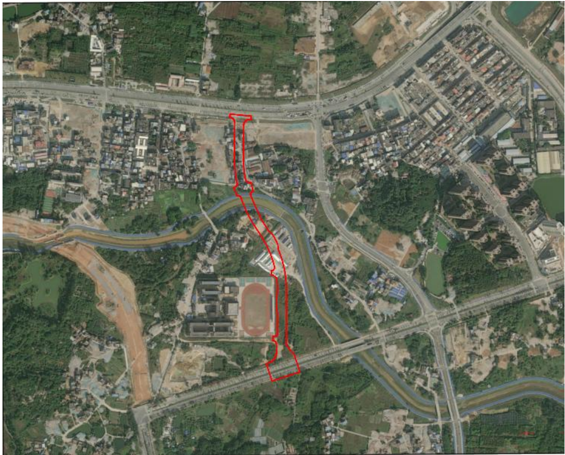
图 8 工程用地航拍全景