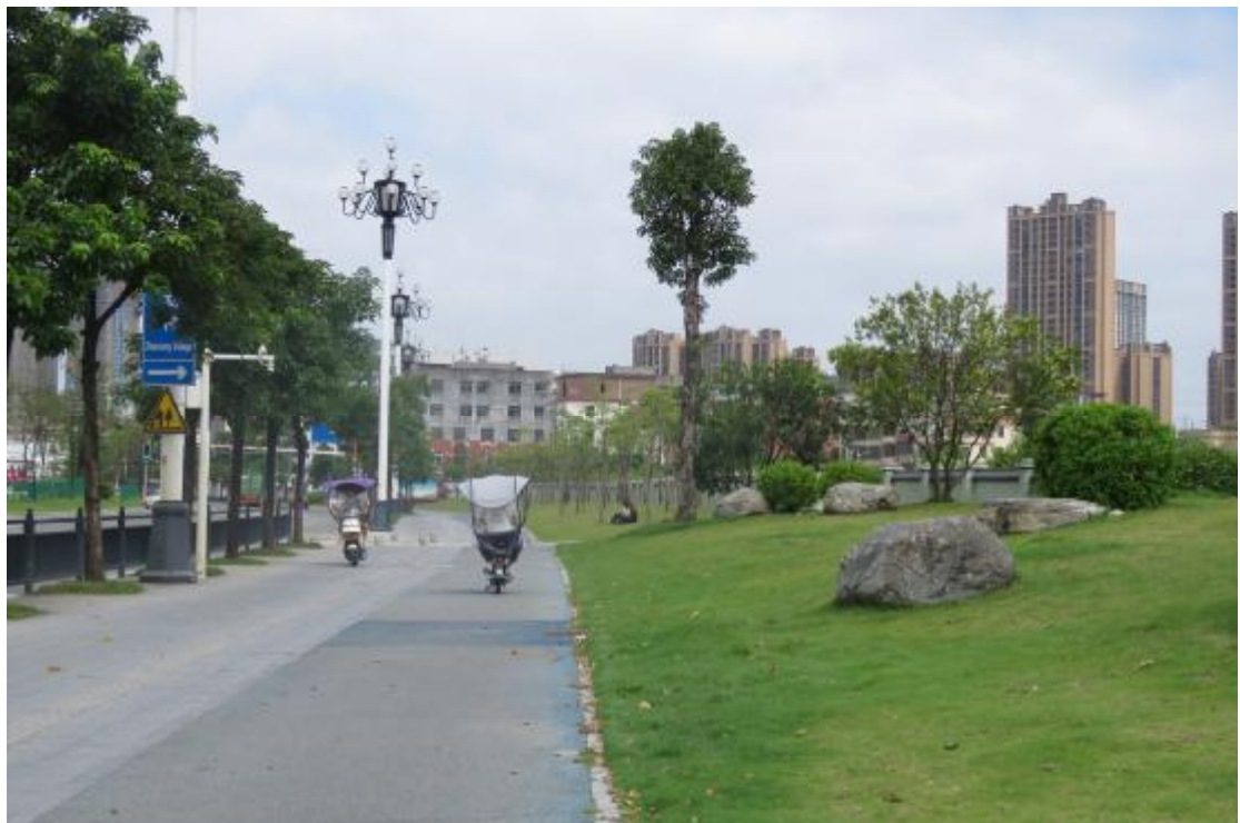
图 11 工程用地北部地表现状（西-东）