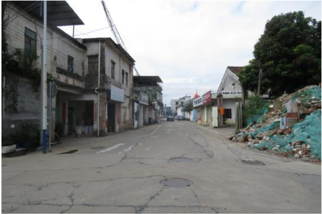
图 24 工程用地块中部地表现状（南-北）