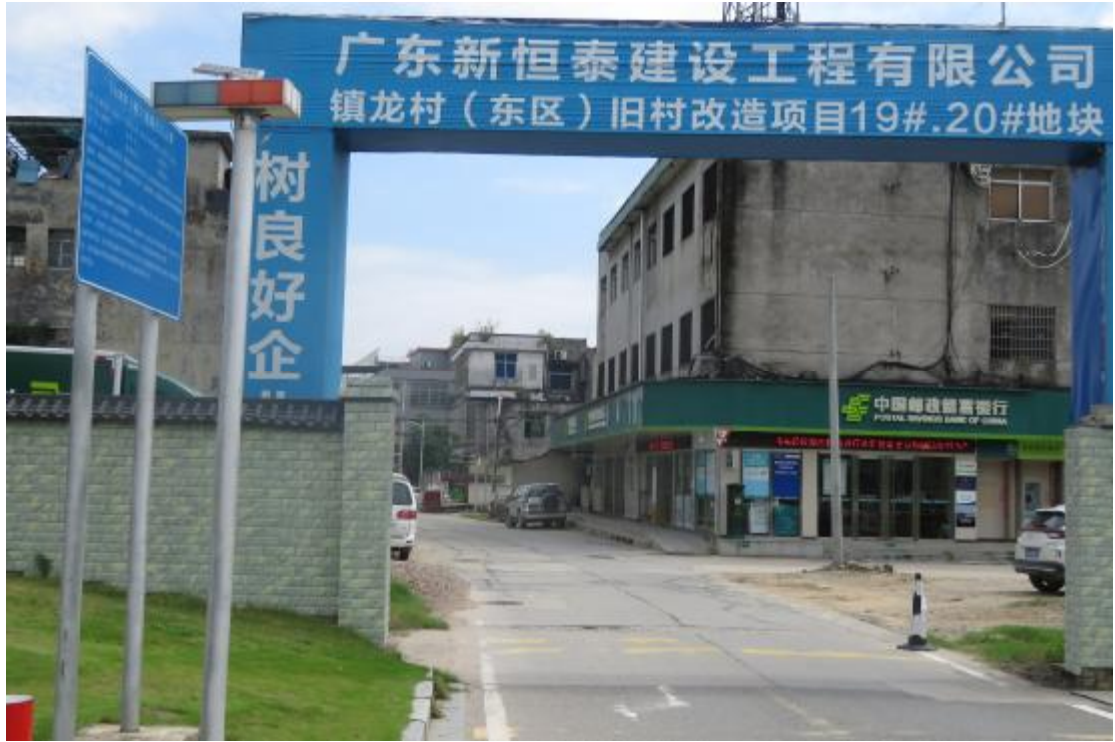
图 10 工程用地北部地表现状（北-南）