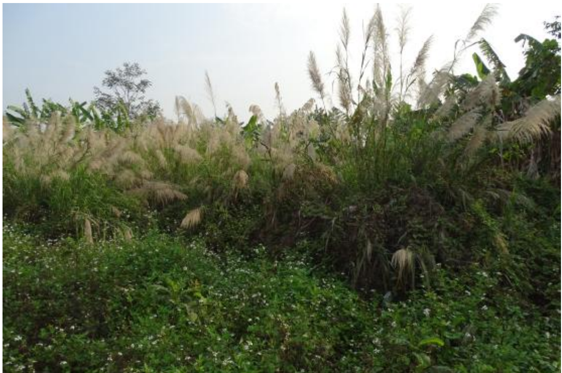
图 35 工程用地南部地表现状（南-北）