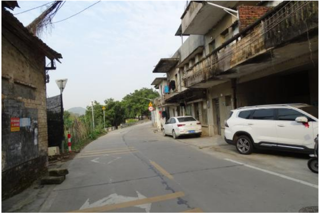
图 20 工程用地北部地表现状（东-西）