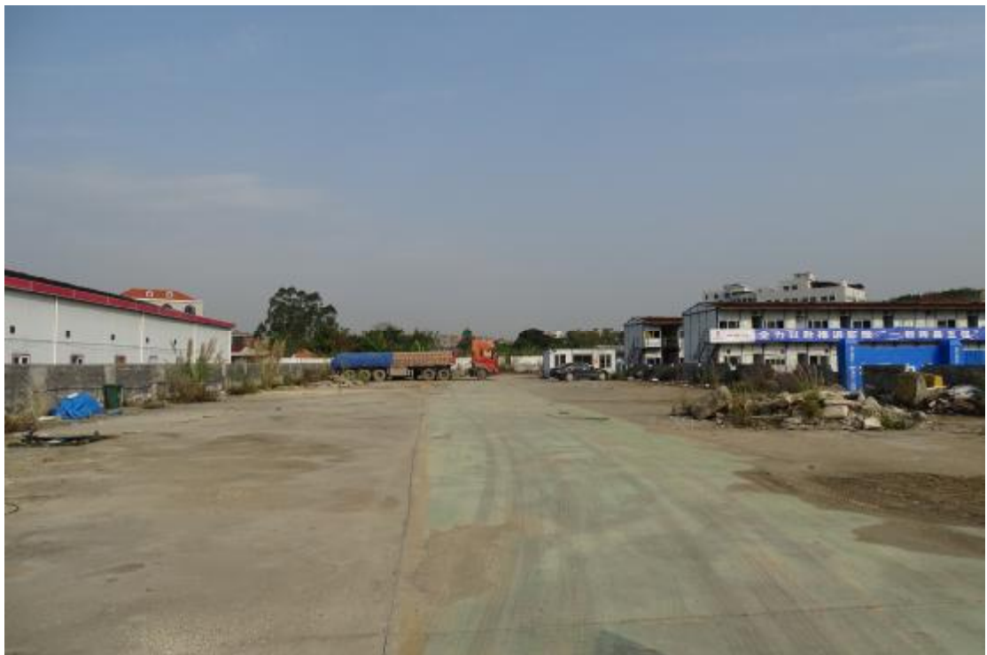
图 41 工程用地南部地表现状（东-西）