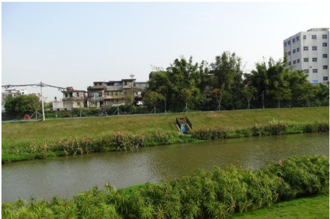
图 45 工程用地南部地表现状（南-北）