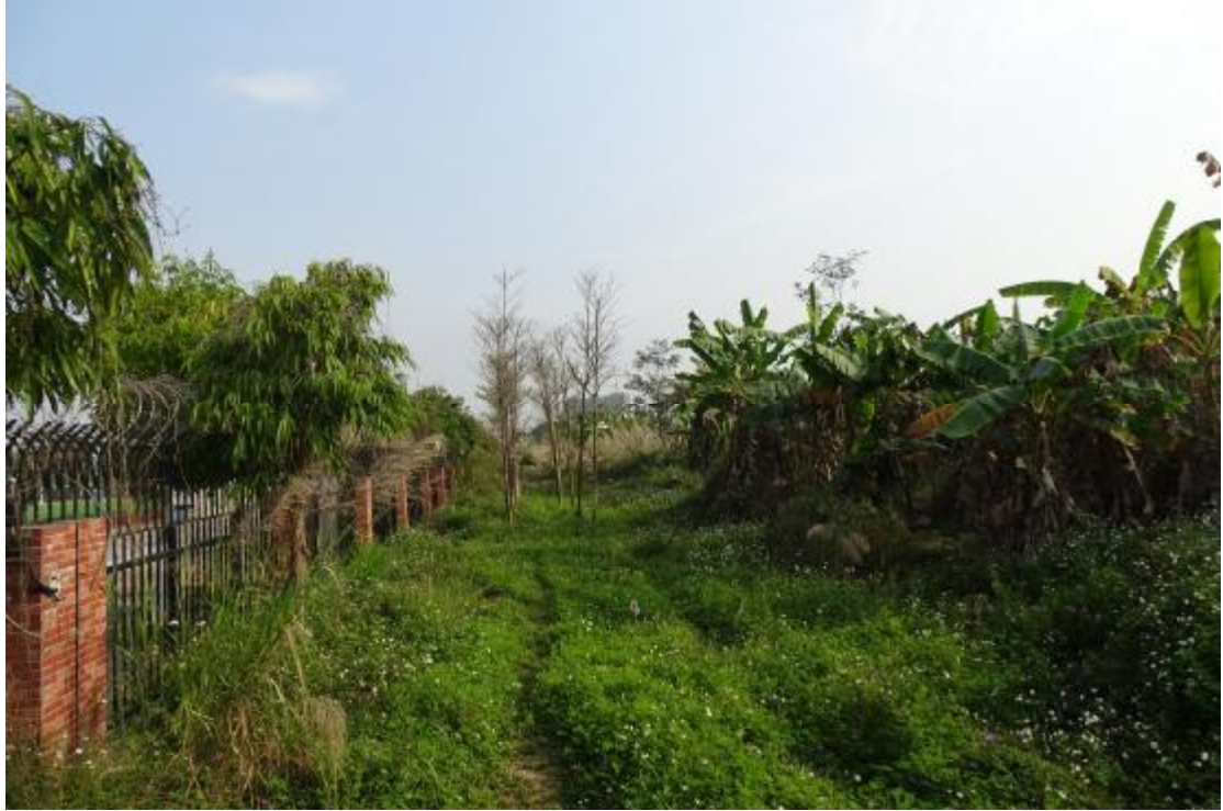
图 34 工程用地南部地表现状（南-北）