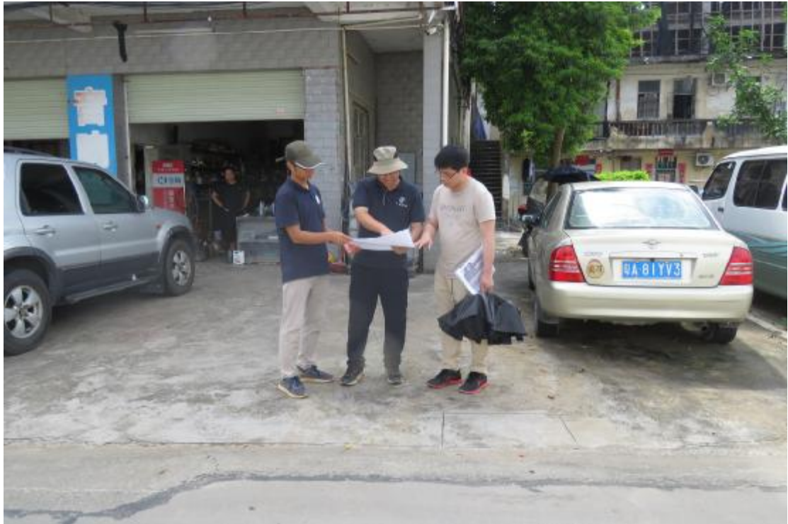
图 6 与现场工作人员确认工程用地范围（西-东）