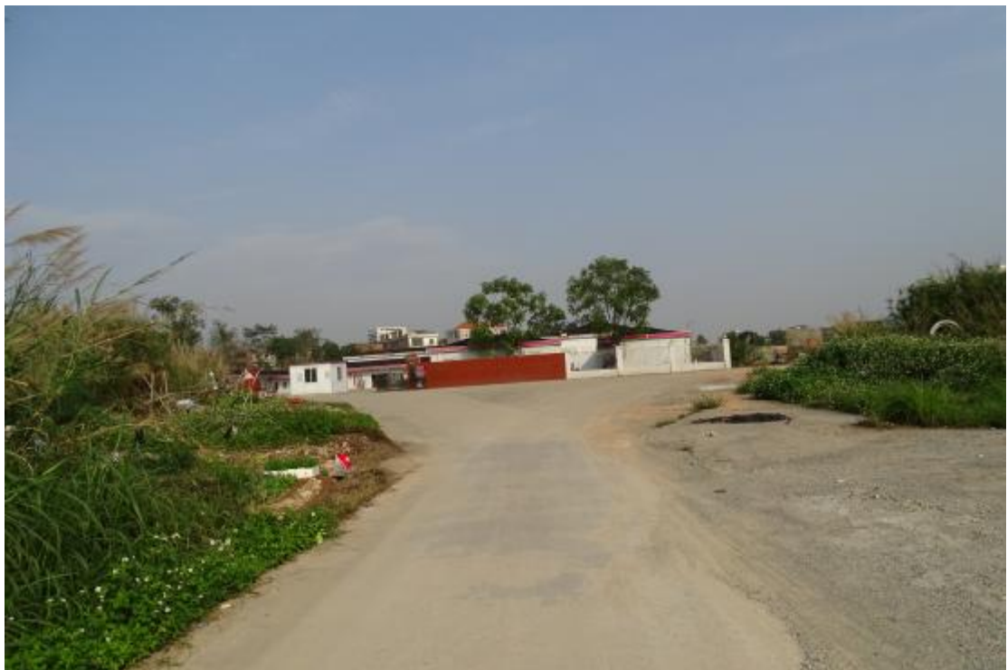
图 39 工程用地南部地表现状（东-西）