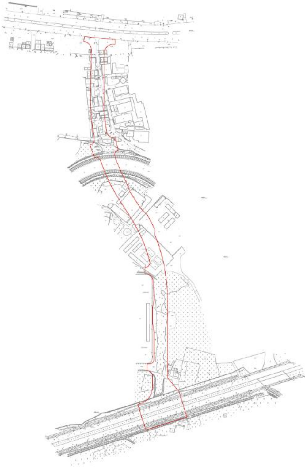
图 5 工程用地红线图（甲方提供）