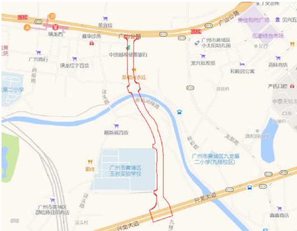
图 4 工程用地周边环境示意图