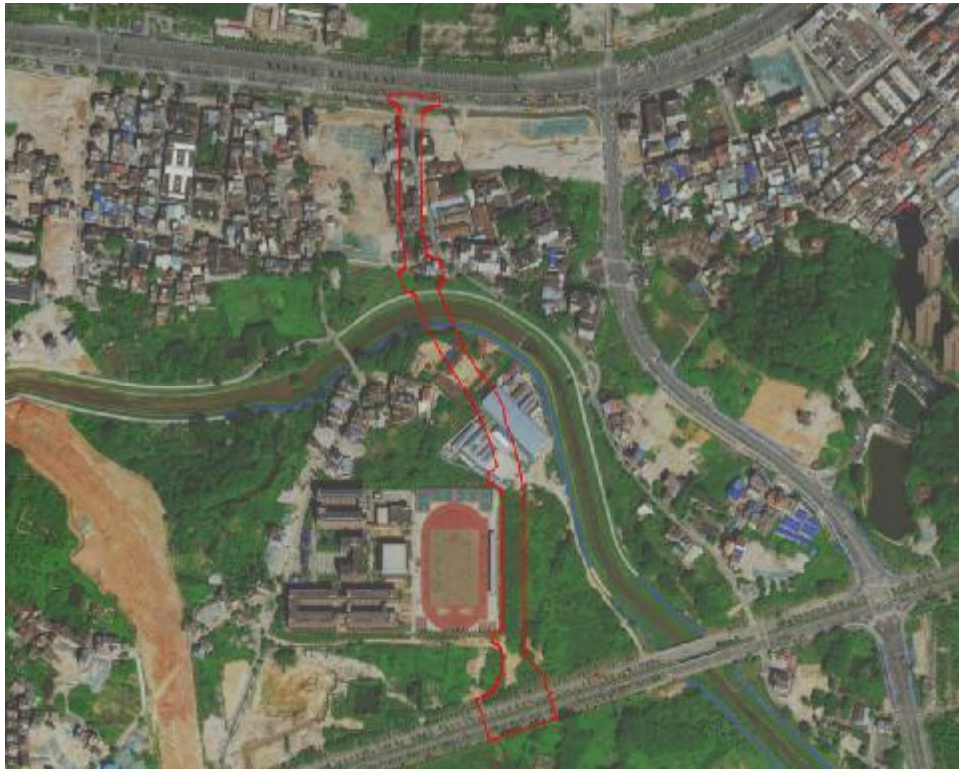
图 3 工程用地卫星红线图（高德卫星地图）