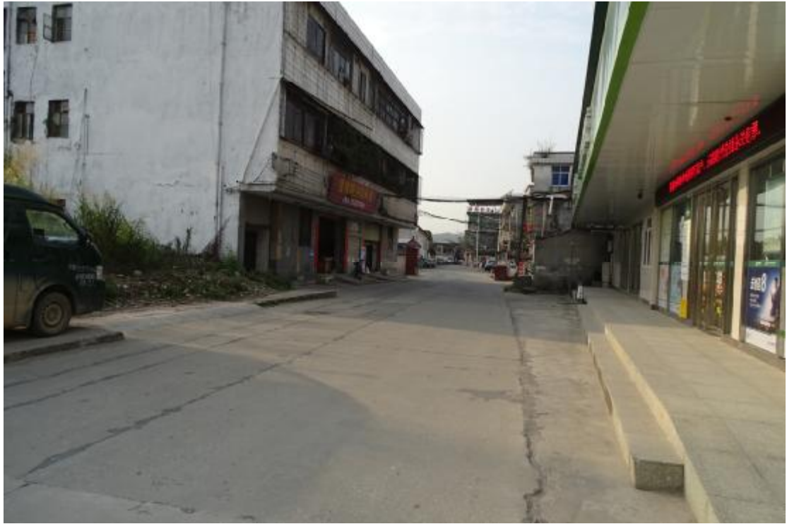
图 16 工程用地北部地表现状（北-南）