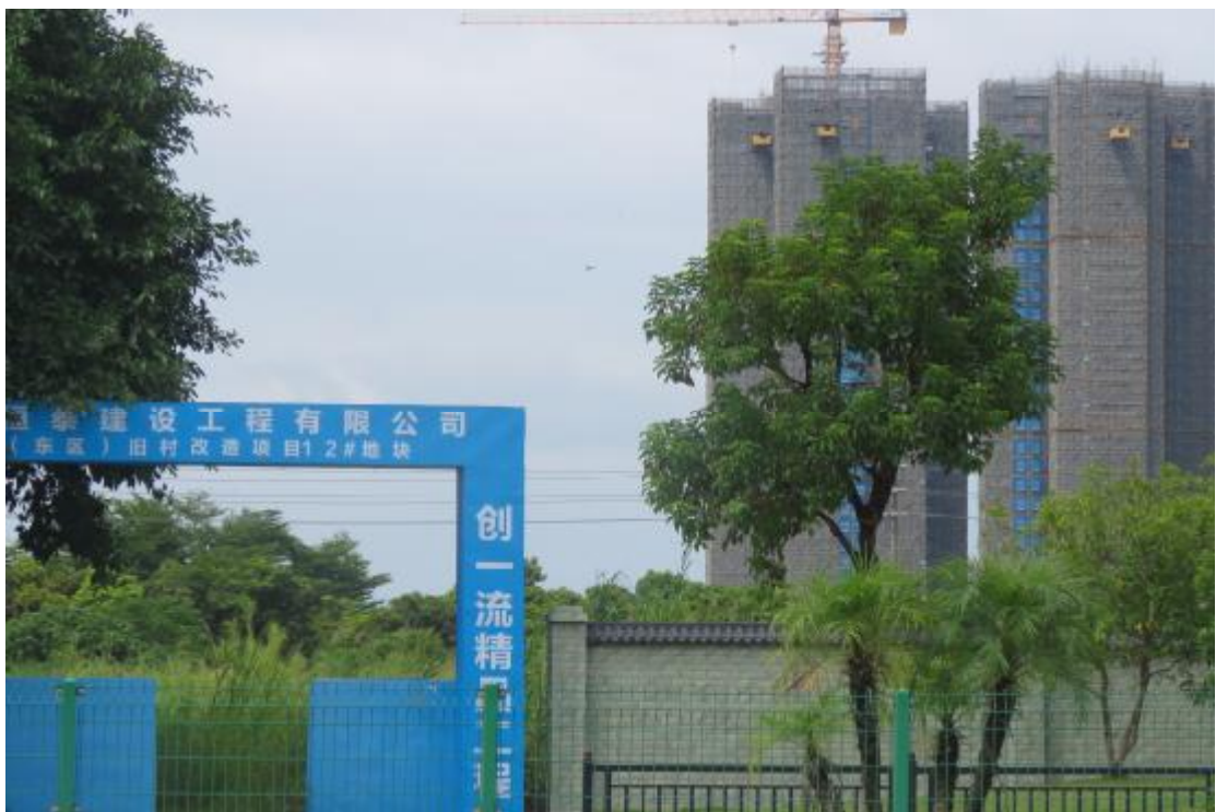
图 9 工程用地北部地表现状（南-北）