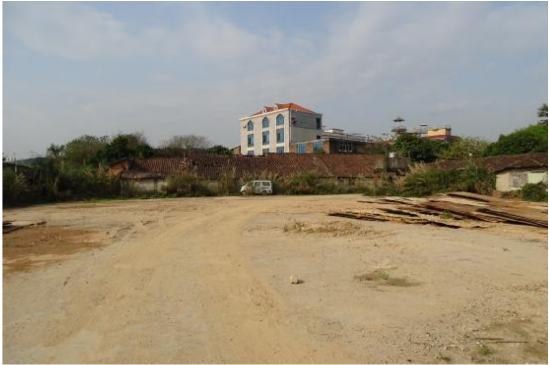
图 44 工程用地南部地表现状（东-西）