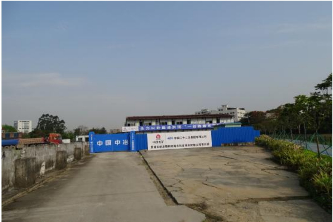
图 42 工程用地南部地表现状（东-西）