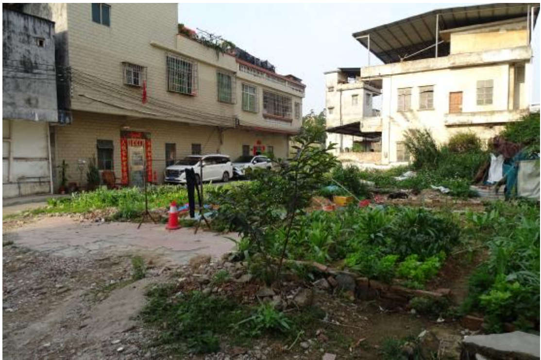
图 17 工程用地北部地表现状（东-西）