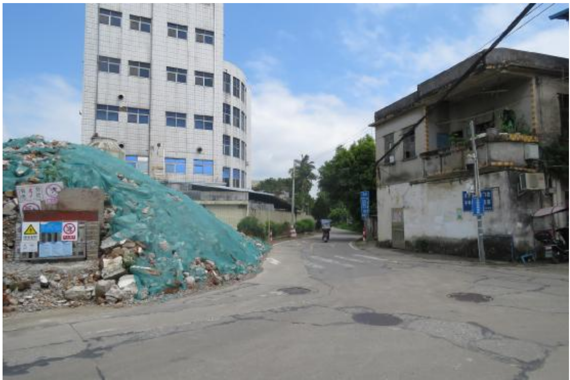
图 23 工程用地中部地表现状（西-东）