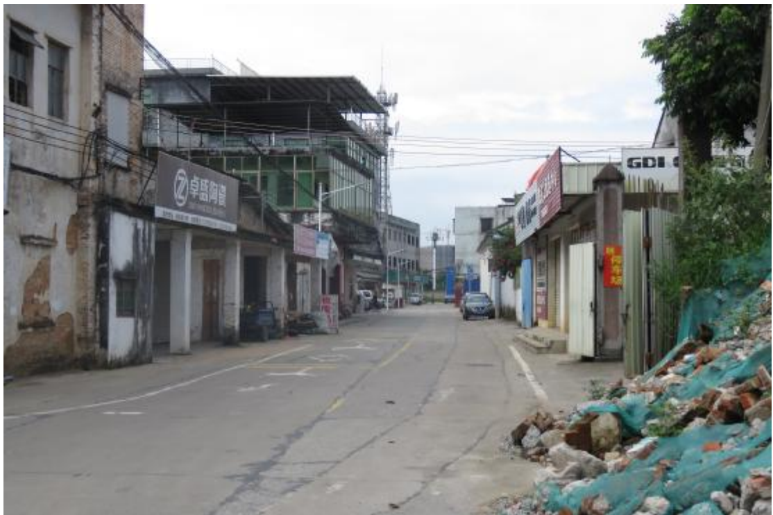
图 25 工程用地中部地表现状（东-西）