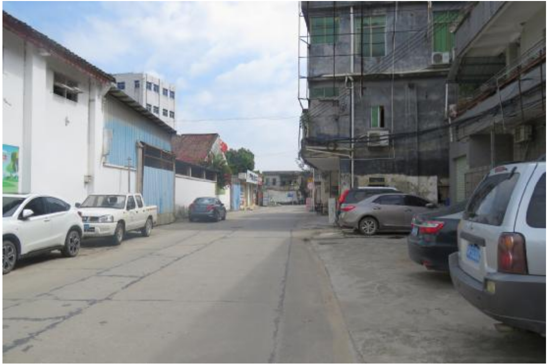
图 22 工程用地块中部地表现状（南-北）