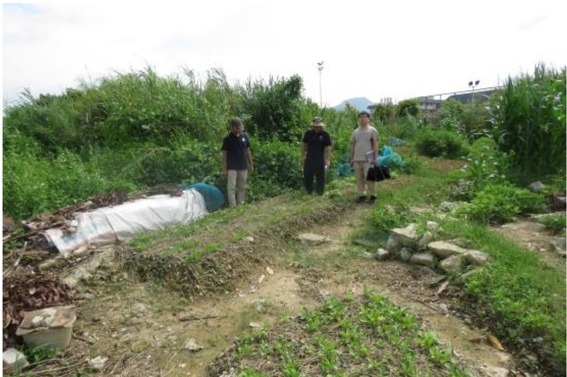
图 7 对工程用地地表进行踏查（北-南）