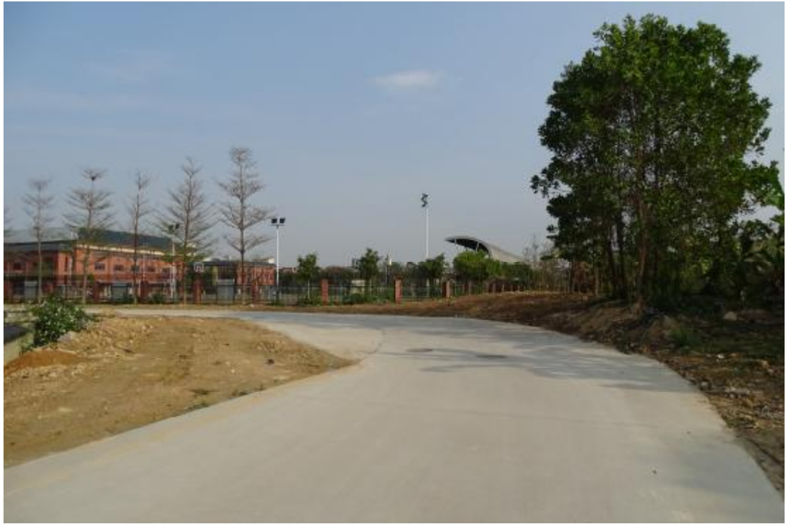
图 30 工程用地南部地表现状（南-北）