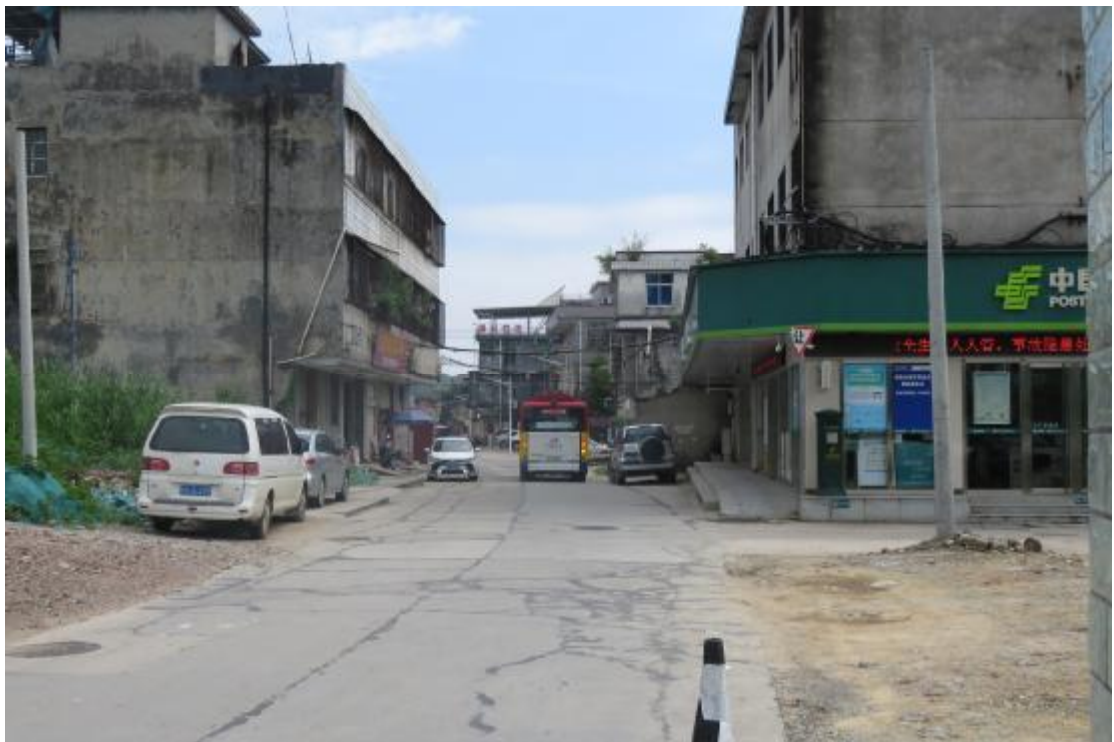
图 13 工程用地北部地表现状（北-南）