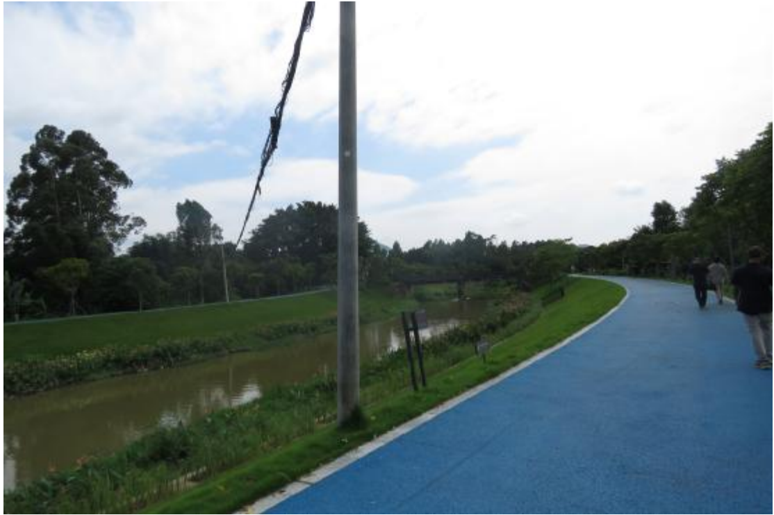
图 46 工程用地南部地表现状（北-南）