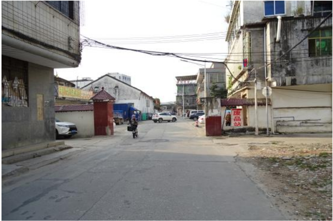
图 18 工程用地北部地表现状（北-南）