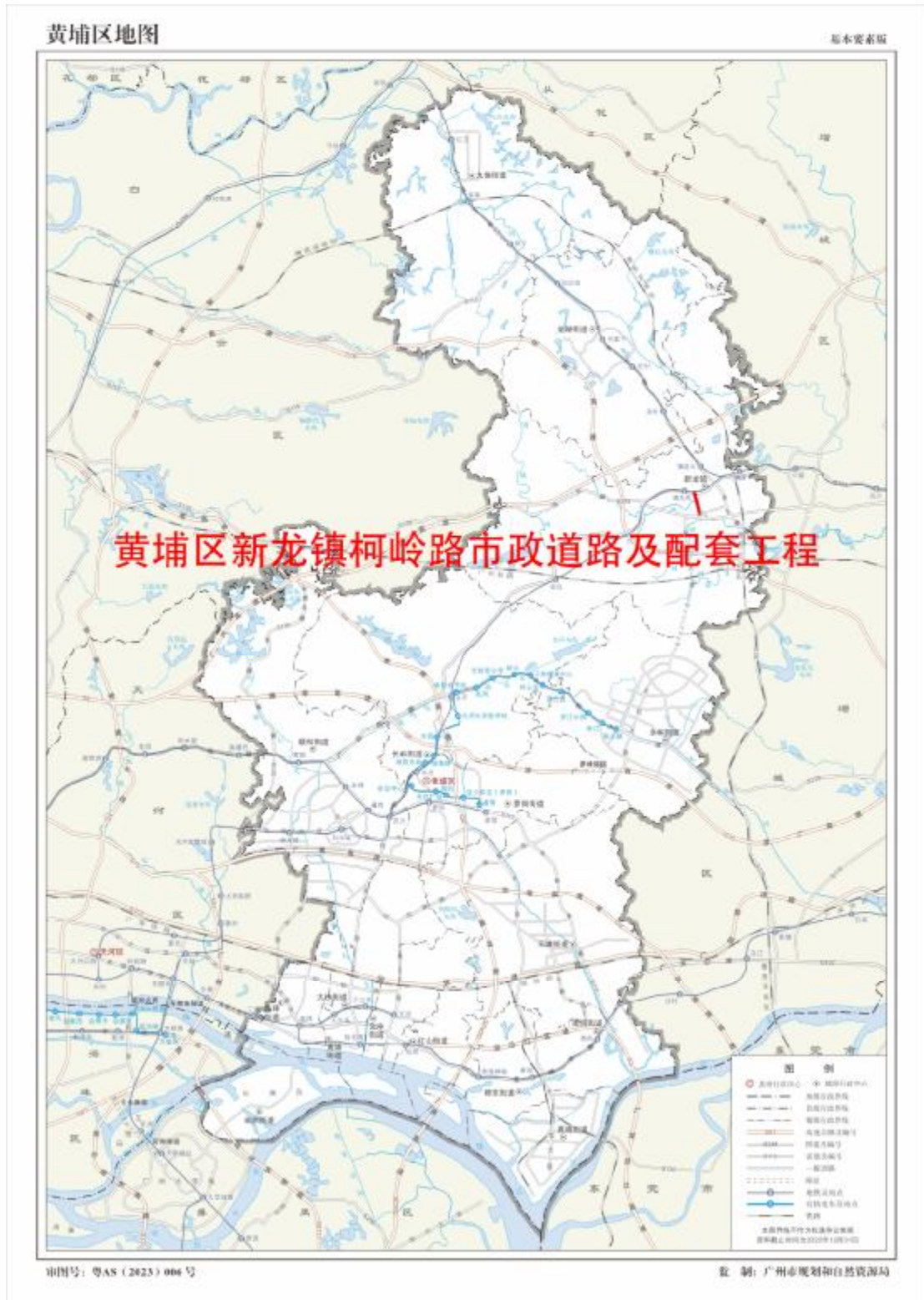
图 2 工程用地在黄埔区位置示意图 (广州市规划和自然资源局)