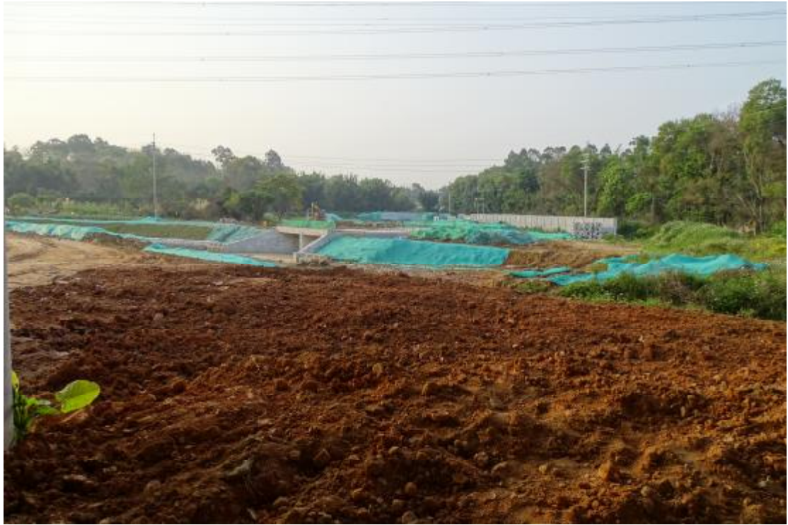
图 14 工程用地北部地表现状（北-南）