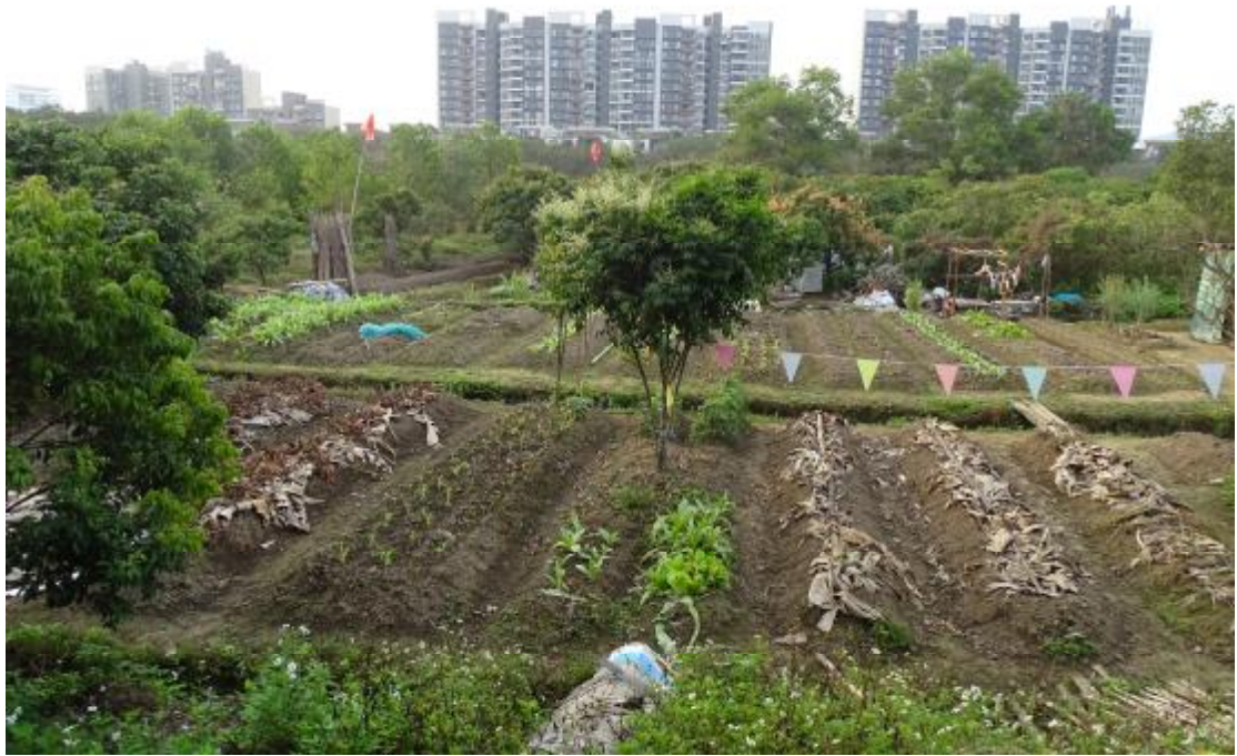
图 42 工程用地南部地表现状（北-南）