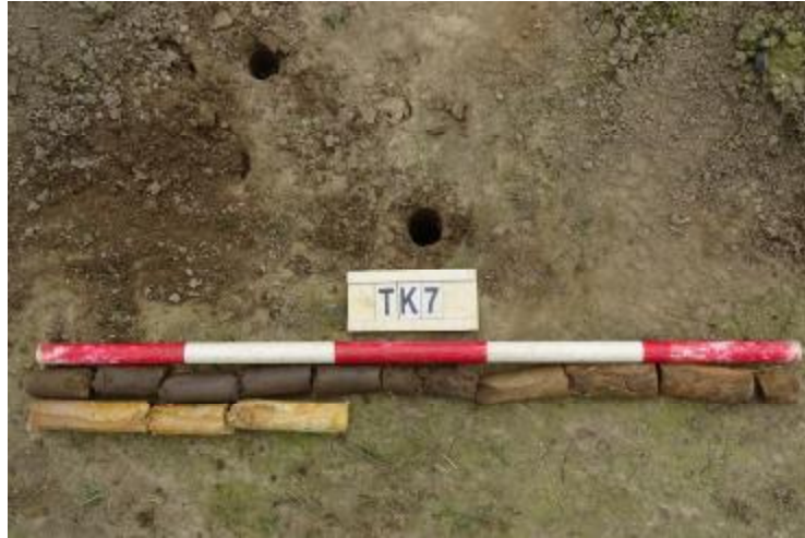
图 64 TK7 土样 (一米标杆, 土样由左上往右下)

②层: 黏土层, 距地表深约 0.6-1.0 米, 厚约 0.4 米, 为灰褐色黏土, 土质较致密, 含植物根系等; 以下为黄褐色风化黏土, 土质致密、纯净, 系生土。