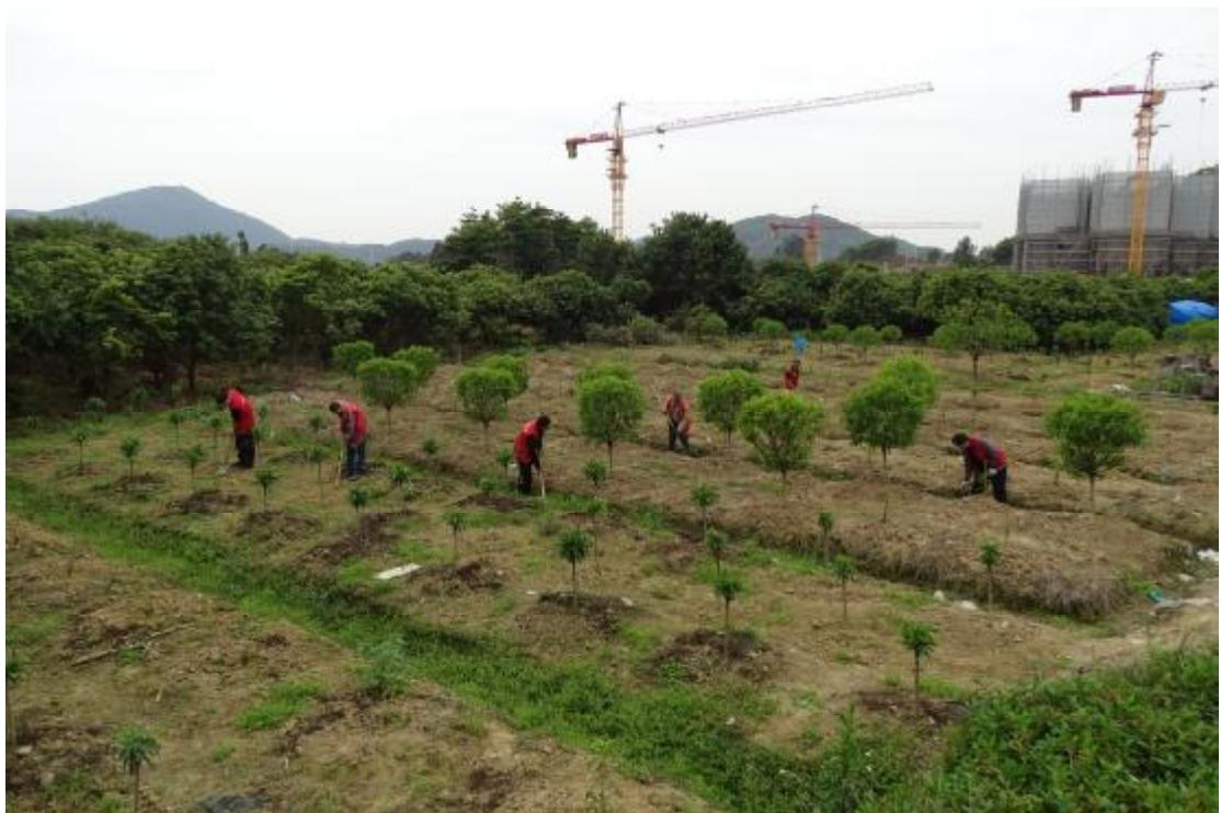
图 11 对工程用地南部地表进行踏查（南-北）