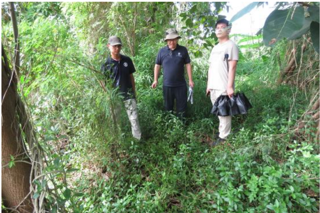
图 9 对工程用地地表进行踏查（西-东）