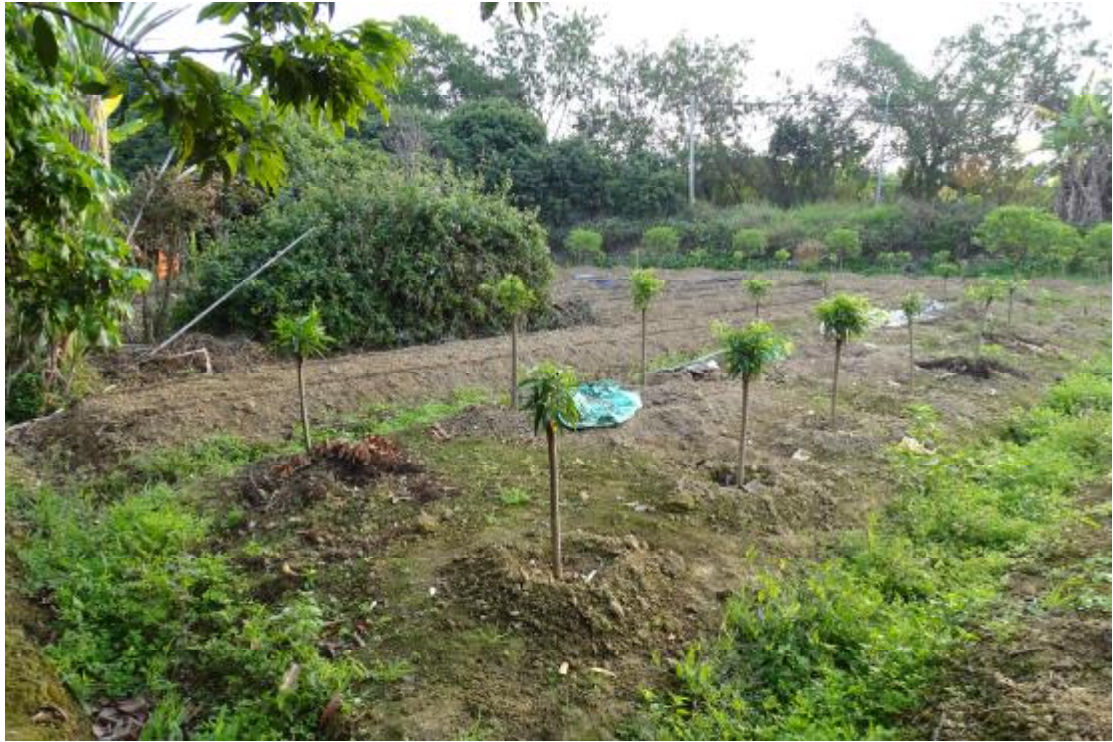
图 34 工程用地南部地表现状（南-北）