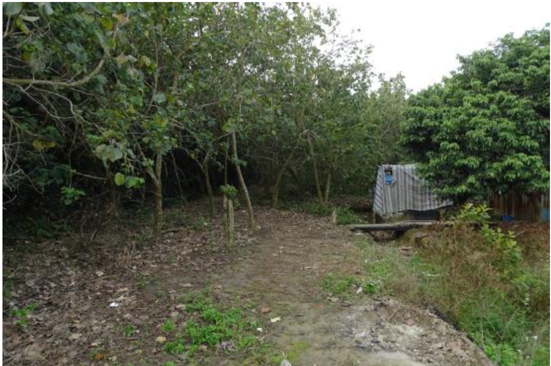
图 47 工程用地南部地表现状（北-南）