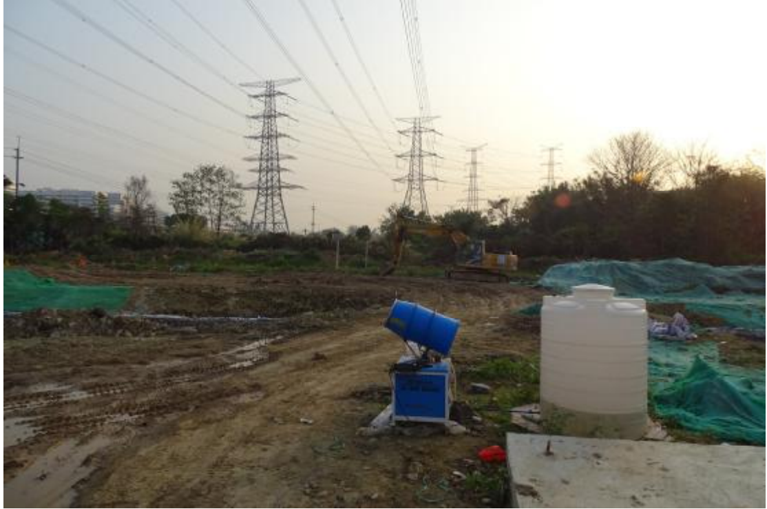
图 16 工程用地北部地表现状（北-南）