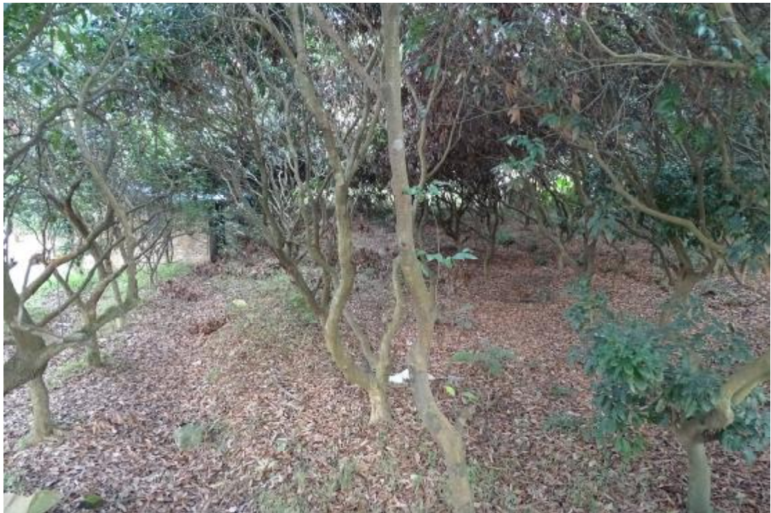
图 35 工程用地南部地表现状（南-北）