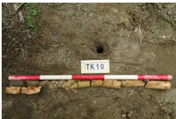
图 67 TK10 土样 (一米标杆, 土样由左上往右下)

②层: 沙土层, 距地表深约 0.2-0.6 米, 厚约 0.4 米, 为黄褐色沙土, 土质较疏松, 含植物根系等; 以下为红褐色风化黏土, 土质致密、纯净, 系生土。