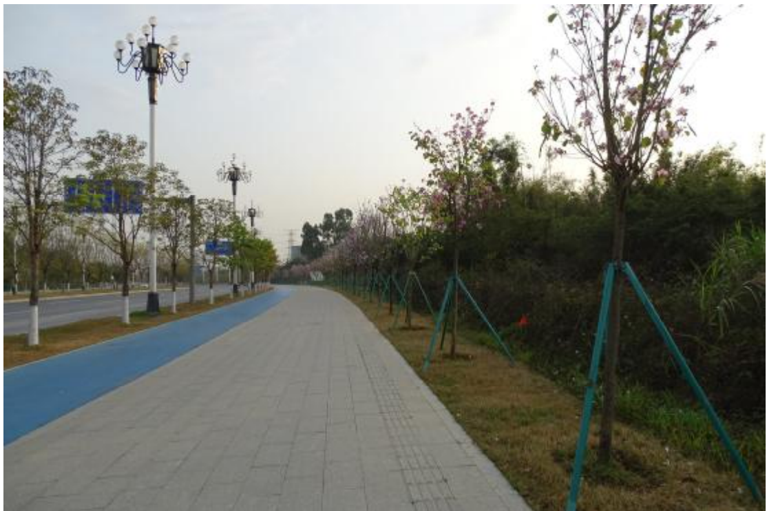
图 27 工程用地北部地表现状（西-东）