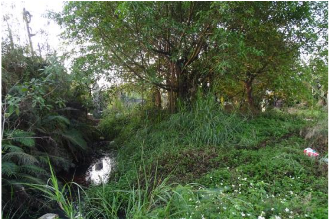
图 21 工程用地北部地表现状（北-南）