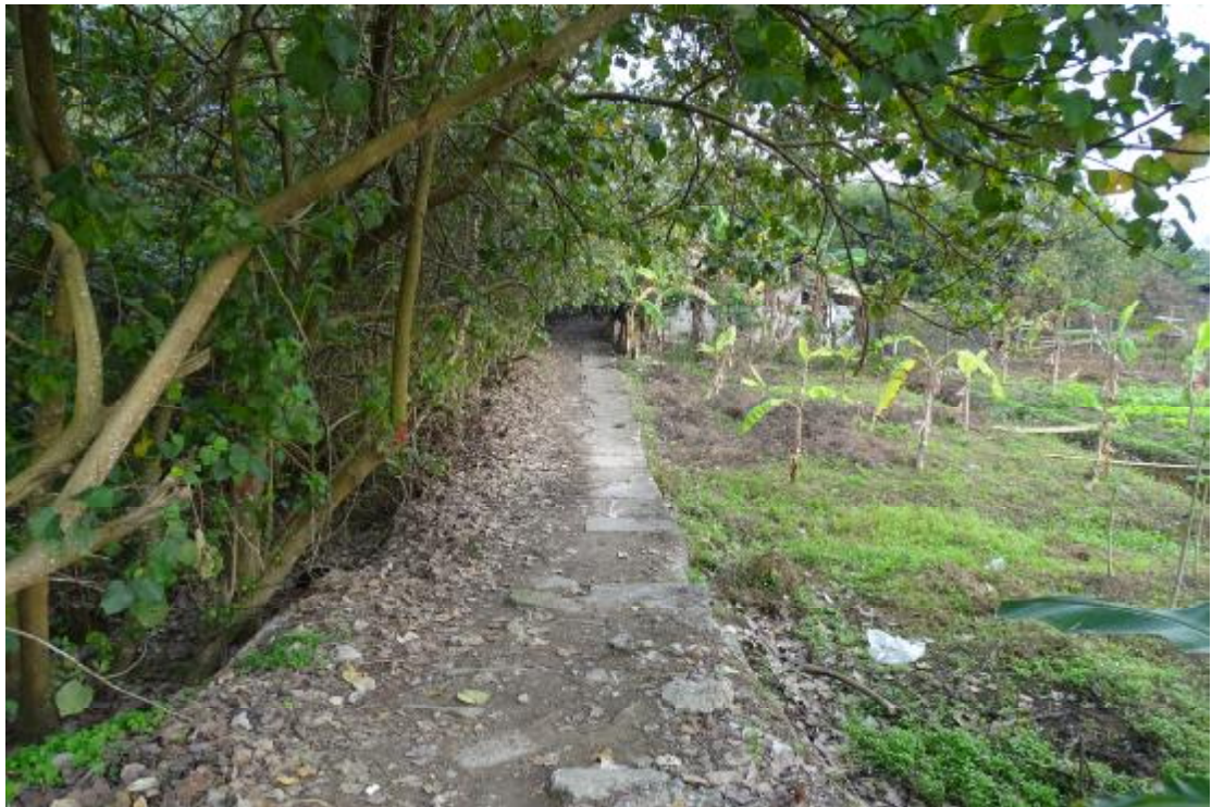
图 43 工程用地南部地表现状（南-北）