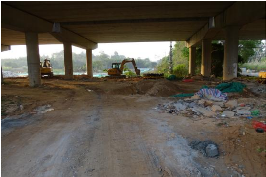
图 13 工程用地北部地表现状（北-南）