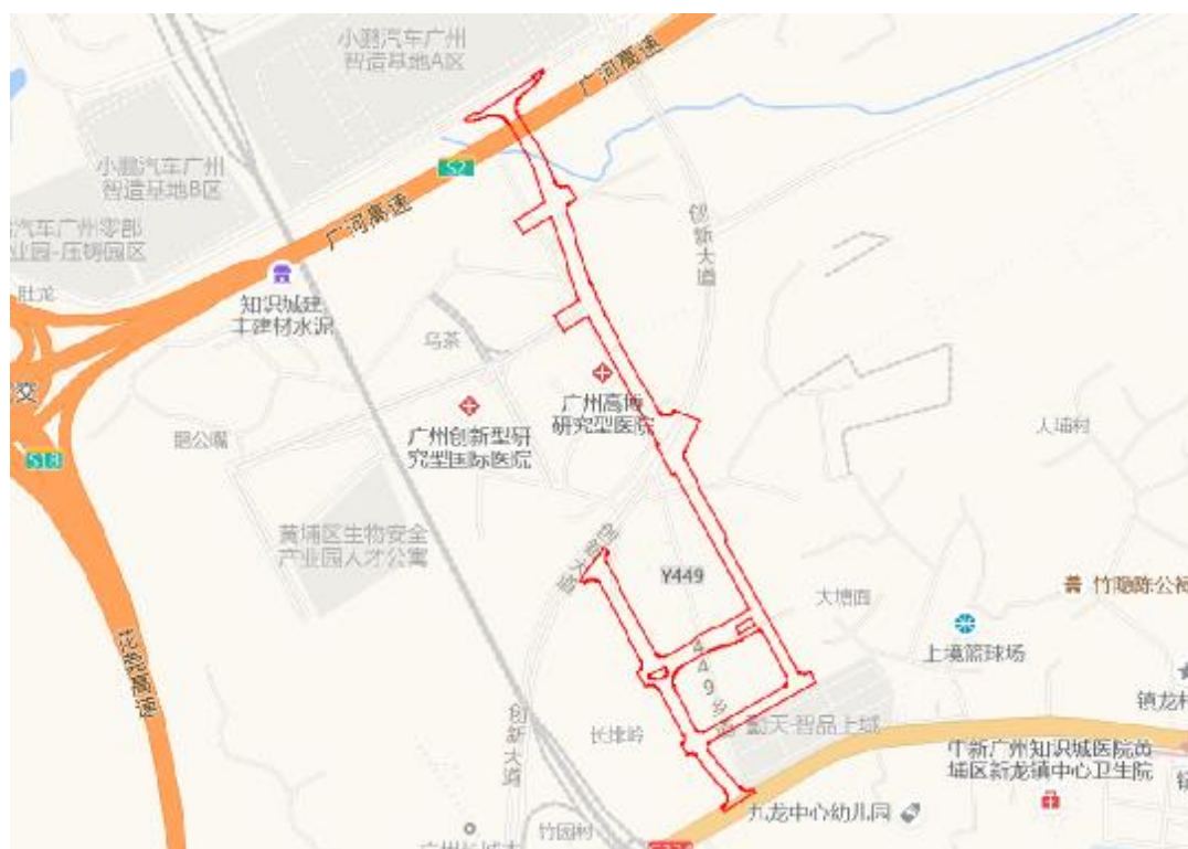
图 4 工程用地周边环境示意图（高德地图）