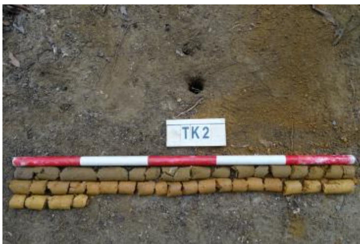
图 59 TK2 土样 (一米标杆, 土样由左上往右下)

②层: 黏土层, 距地表深约 1.0-1.8 米, 厚约 0.8 米, 为红褐色黏土, 土质较致密, 含植物根系等; 以下为黄褐色风化黏土, 土质致密、纯净, 系生土。