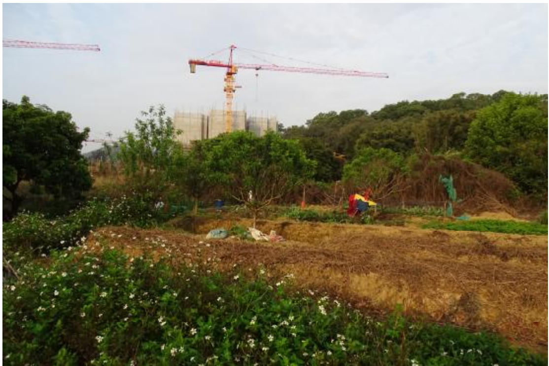
图 31 工程用地南部地表现状（东-西）