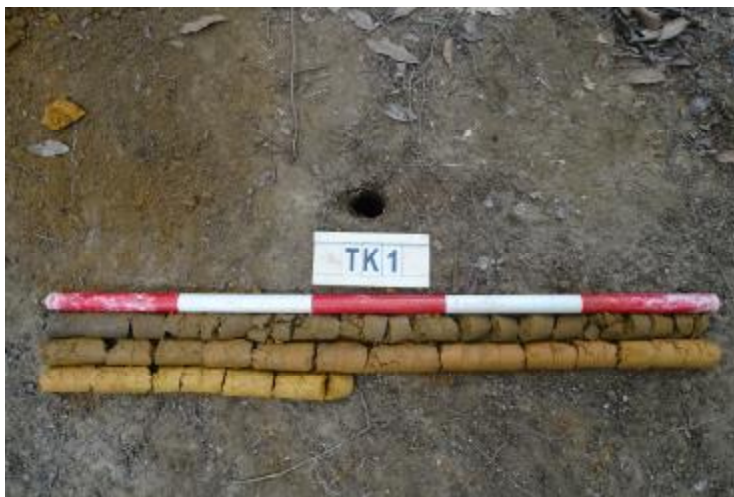
图 58 TK1 土样 (一米标杆, 土样由左上往右下)

②层: 黏土层, 距地表深约 1.4-2.1 米, 厚约 0.7 米, 为红褐色黏土, 土质较致密, 含植物根系等; 以下为黄褐色风化黏土, 土质致密、纯净, 系生土。