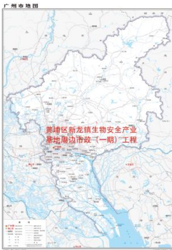
图 1 工程用地在广州市位置示意图（广东省国土资源厅）

根据《中华人民共和国文物保护法》《广州市文物保护规定》，按照《广州市文物局黄埔区新龙镇柯岭路市政道路及配套工程等 5 个项目考古调查勘探工作的复函》（文物 2023453 号）的指导意见，受广州开发区财政投资建设项目管理中心委托，由我院配合该工程用地建设，对该地块进行考古调查工作。