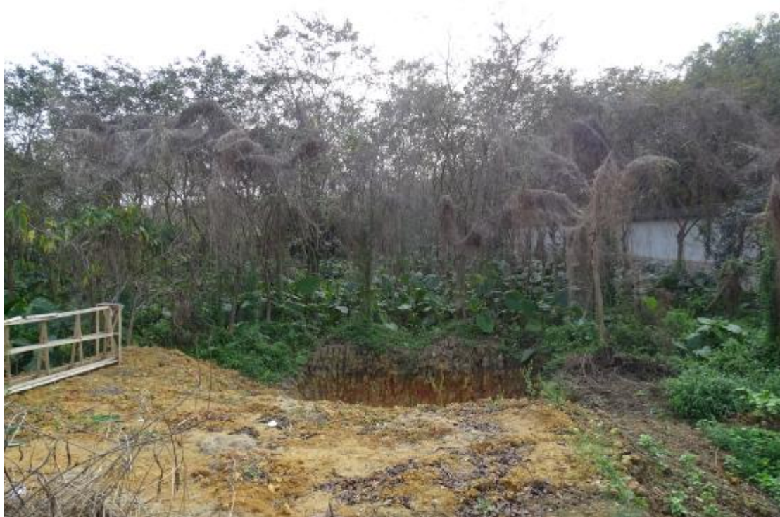
图 50 工程用地南部地表现状（西-东）