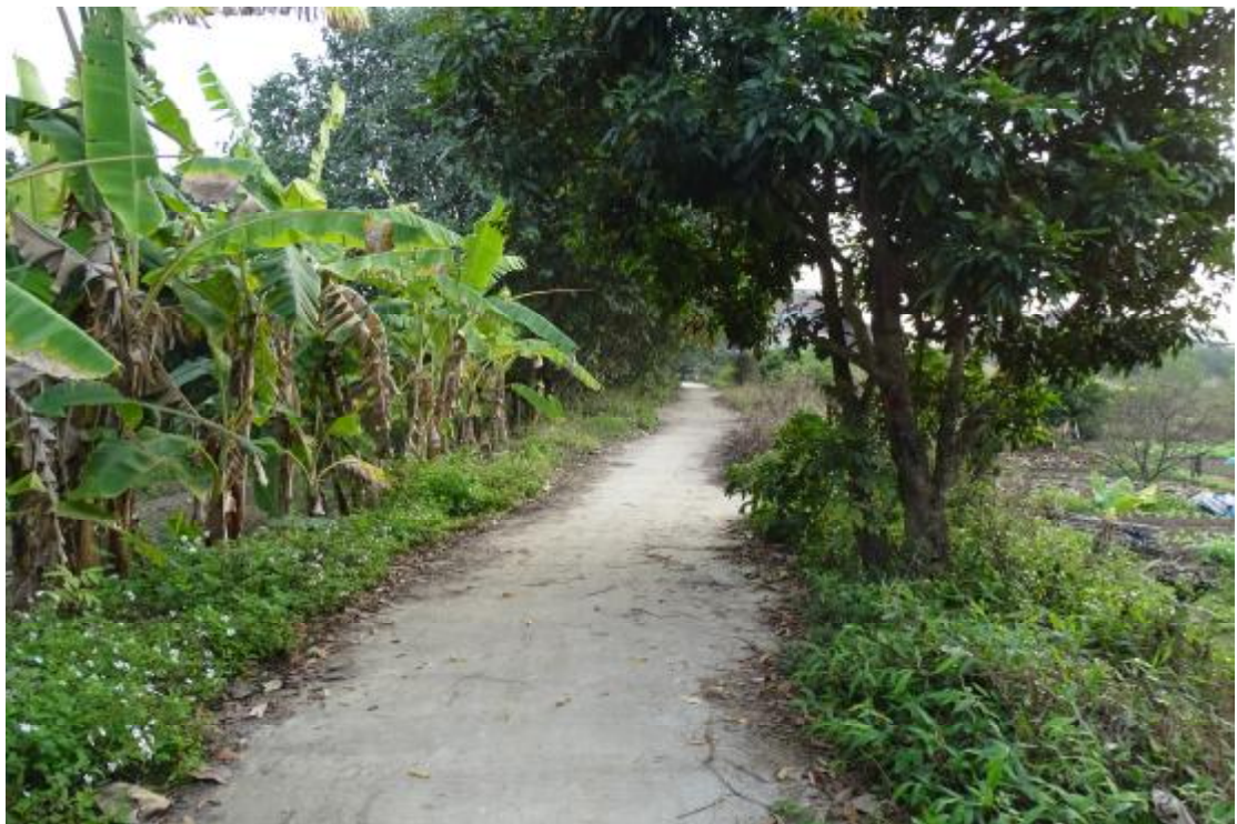
图 39 工程用地南部地表现状（西-东）