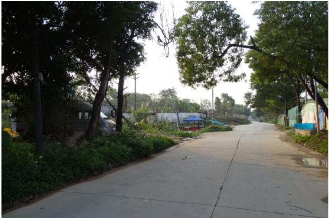
图 17 工程用地北部地表现状（北-南）