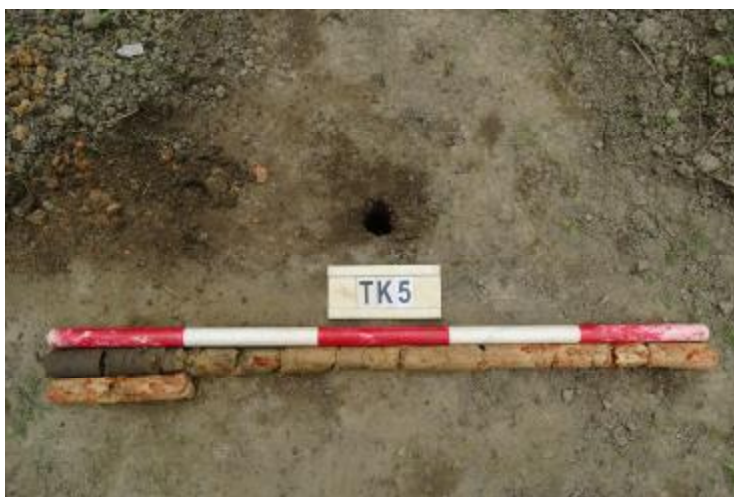
图 62 TK5 土样（一米标杆，土样由左上往右下）

②层：黏土层，距地表深约 0.2-0.6 米，厚约 0.4 米，为灰褐色黏土，土质较致密，含植物根系等；以下为黄褐色风化黏土，土质致密、纯净，系生土。