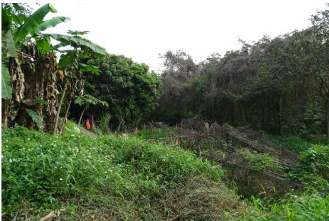
图 51 工程用地南部地表现状（西-东）