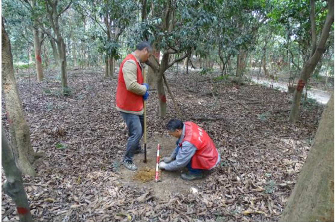
图 56 试探土样摆放（南-北）