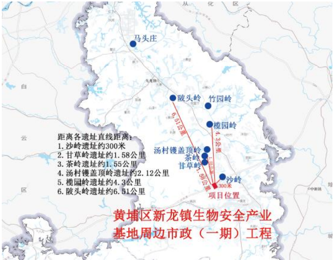
图 7 工程用地与知识城周边遗址位置关系