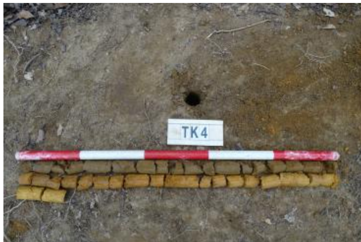
图 61 TK4 土样（一米标杆，土样由左上往右下）

②层：沙土层，距地表深约 1.0-1.6 米，厚约 0.6 米，为红褐色沙土，土质较疏松，含植物根系等；以下为黄褐色风化黏土，土质致密、纯净，系生土。