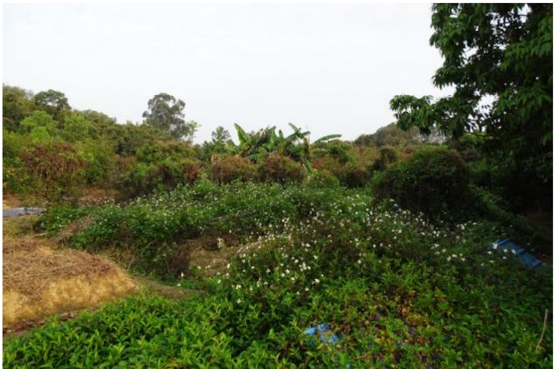
图 29 工程用地南部地表现状（南-北）