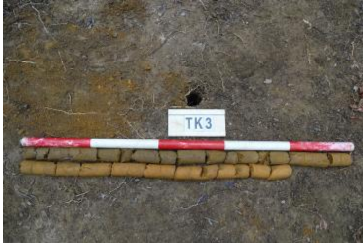
图 60 TK3 土样（一米标杆，土样由左上往右下）

②层：沙土层，距地表深约 0.7-1.4 米，厚约 0.7 米，为黄褐色沙土，土质较疏松，含植物根系等；以下为红褐色沙土，土质疏松、纯净，系生土。