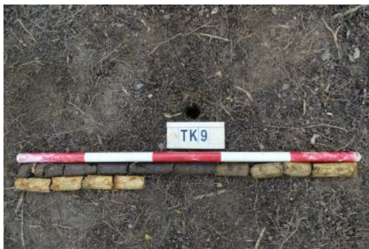
图 66 TK9 土样 (一米标杆, 土样由左上往右下)

②层: 黏土层, 距地表深 0.6-1.0 米, 厚约 0.4 米, 为黄褐色黏土, 土质较致密, 含植物根茎、沙粒等; 以下为黄褐色风化黏土, 土质致密、纯净, 系生土。