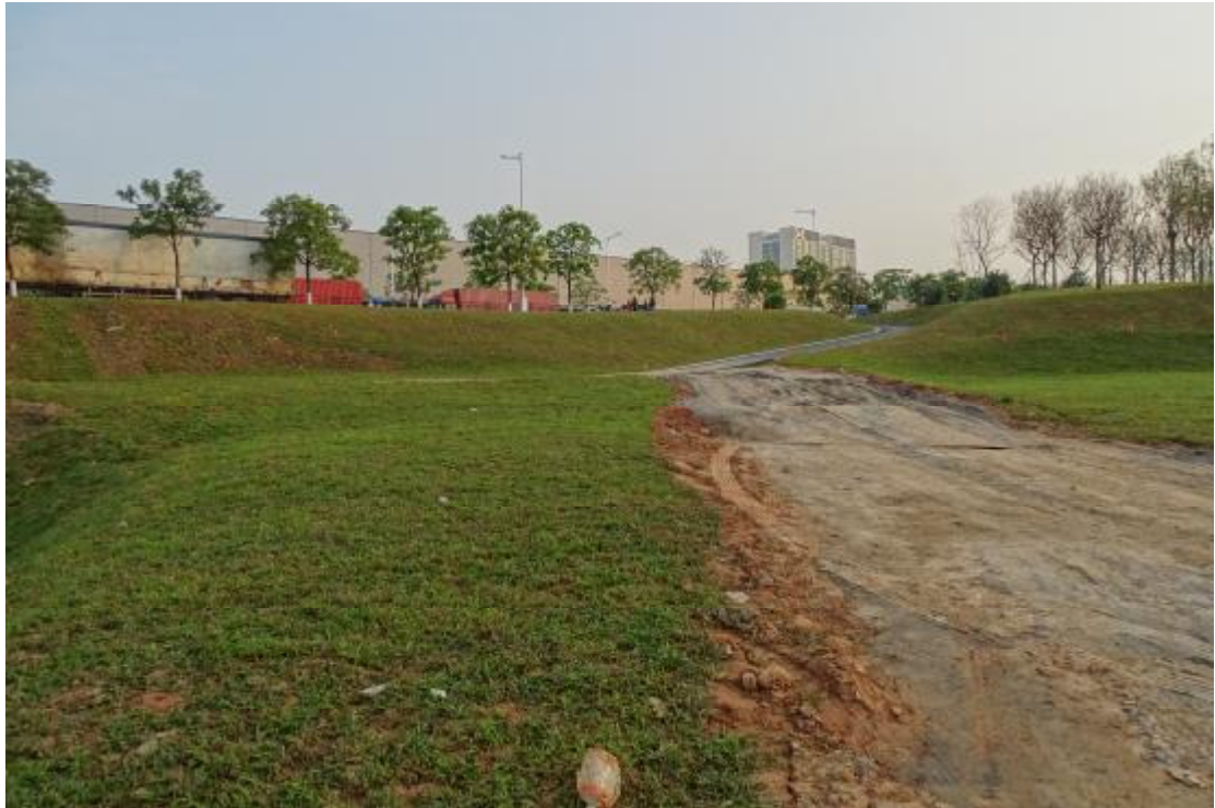
图 12 工程用地北部地表现状（南-北）