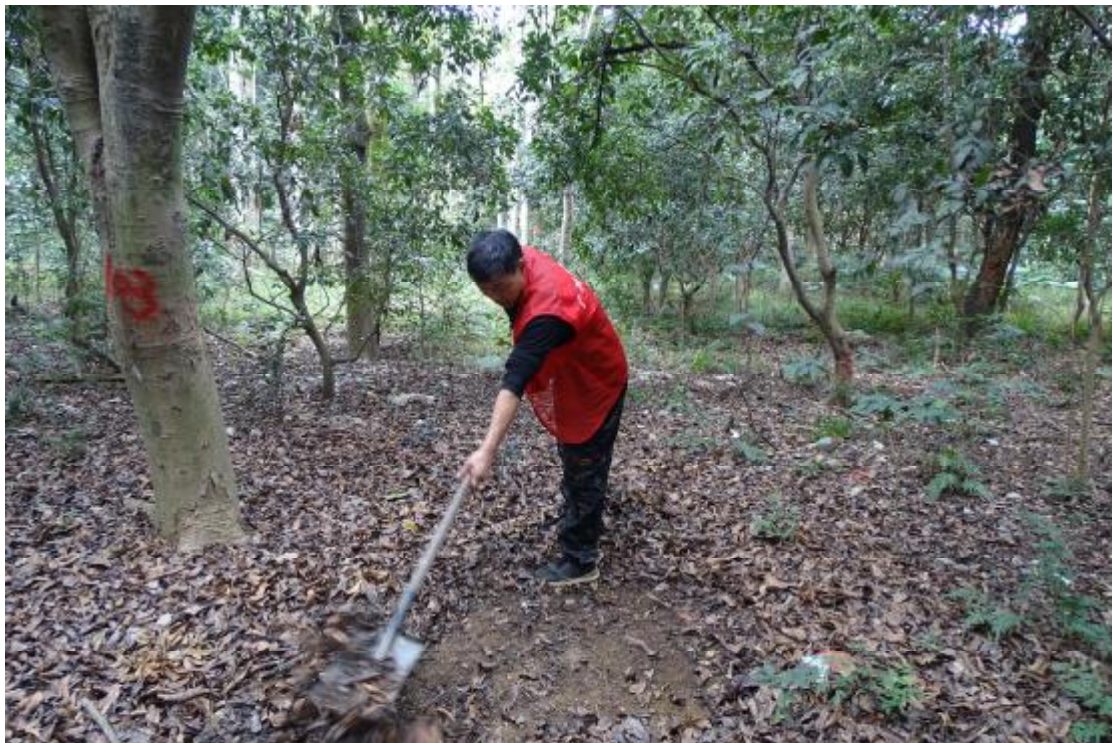
图 53 试探区域清理（南-北）