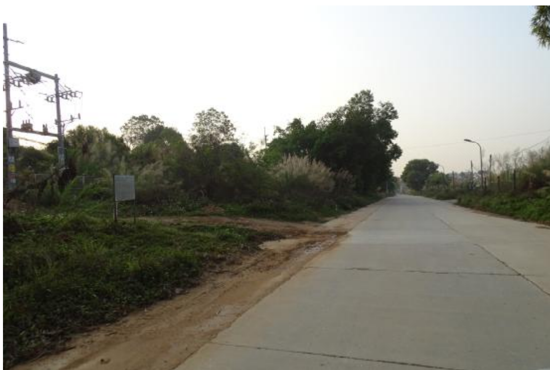
图 19 工程用地北部地表现状（北-南）