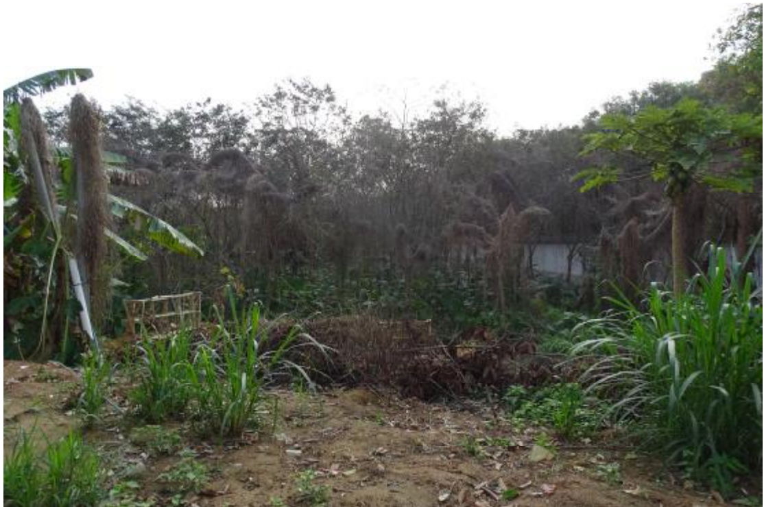
图 49 工程用地南部地表现状（西-东）