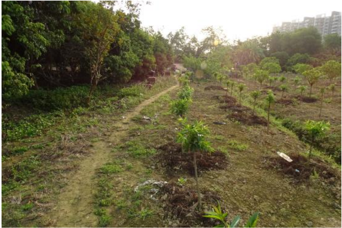
图 30 工程用地南部地表现状（西-东）