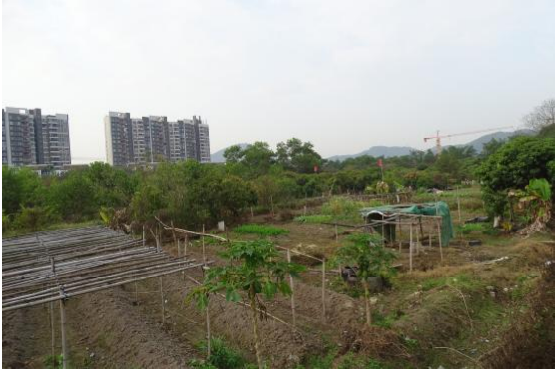
图 48 工程用地南部地表现状（北-南）