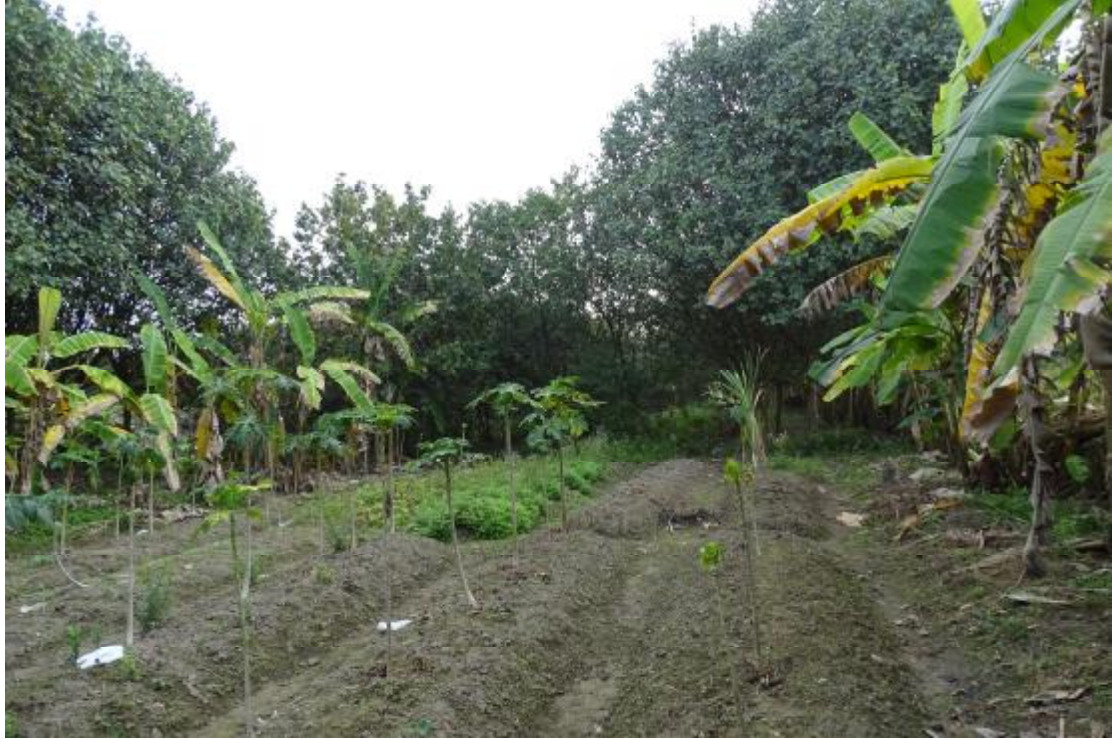
图 40 工程用地南部地表现状（西-东）