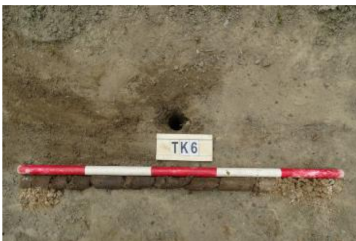
图 63 TK6 土样（一米标杆，土样由左往右）

①层：现代回填土层，距地表深约 0-0.8 米，厚约 0.8 米，为黑褐色黏土，土质较疏松，含植物根系等；以下为黄褐色淤沙，探至 1.1 米遇石块阻拦，无法提取土样。