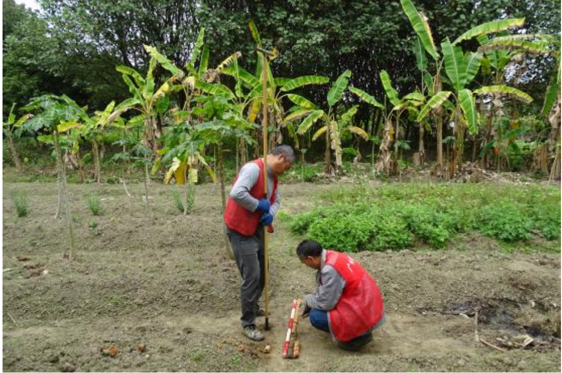
图 54 试探土样提取（东-西）