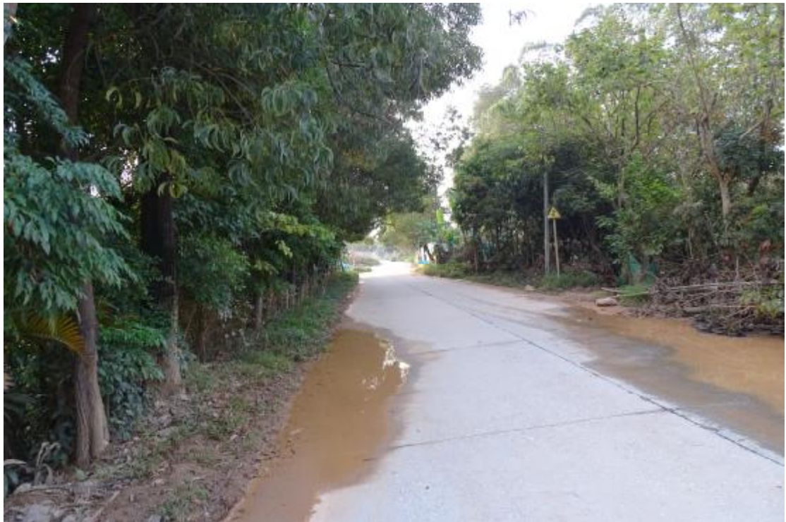
图 15 工程用地北部地表现状（北-南）