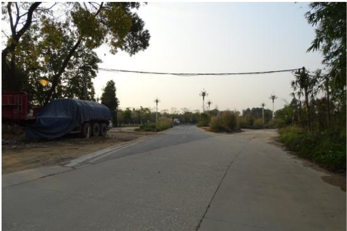
图 25 工程用地北部地表现状（北-南）