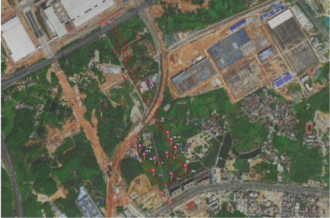
图 52 试探孔位置示意图

为了进一步了解并掌握该工程用地内地层堆积状况，我们在该地块范围内进行试探，地块北部多为硬化路面及房屋，故试探孔分布在南部，共布设 10 个标准型试探孔，编号为 TK1-TK10，具体介绍如下：