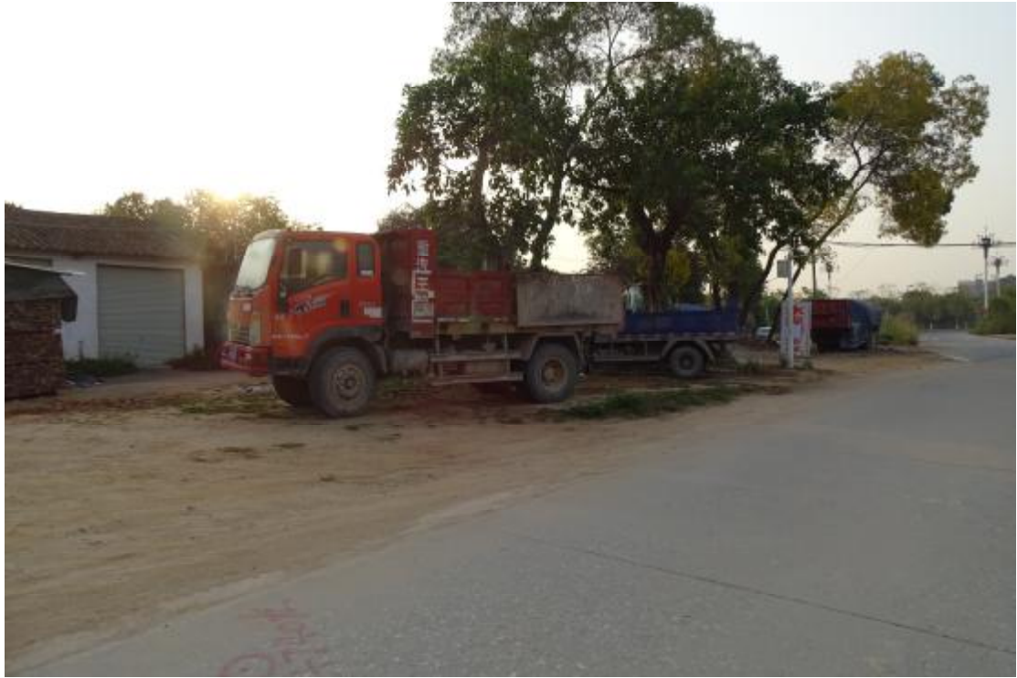
图 24 工程用地北部地表现状（北-南）