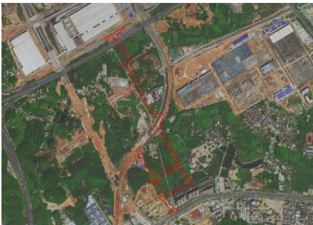
图 3 工程用地卫星红线图