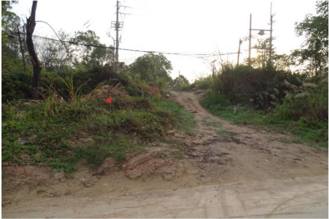
图 20 工程用地北部地表现状（北-南）