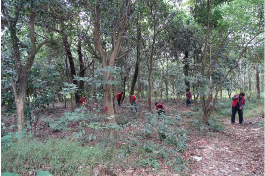
图 10 对工程用地地表进行踏查（西-东）