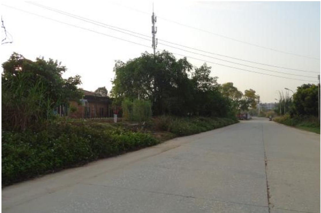
图 23 工程用地北部地表现状（北-南）