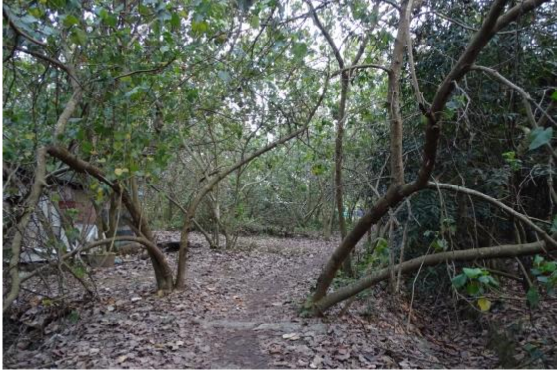
图 44 工程用地南部地表现状（东-西）