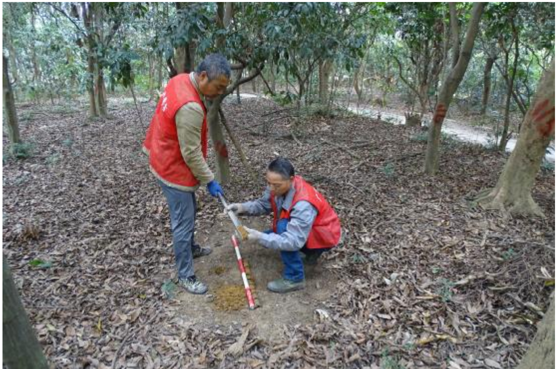
图 55 试探土样分析（南-北）