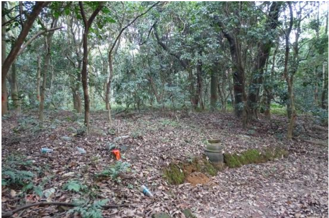
图 37 工程用地南部地表现状（南-北）