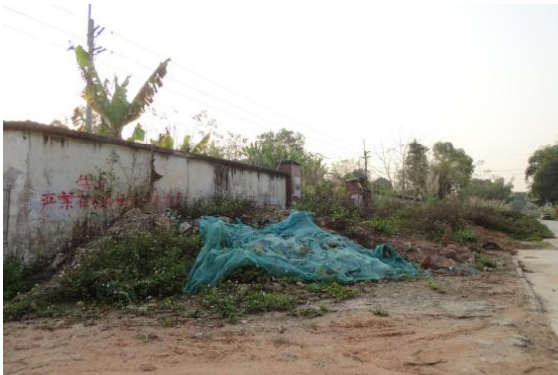
图 18 工程用地北部地表现状（北-南）