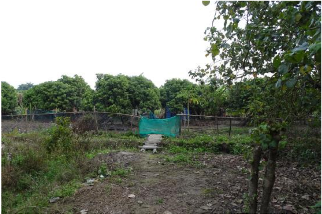
图 46 工程用地南部地表现状（南-北）