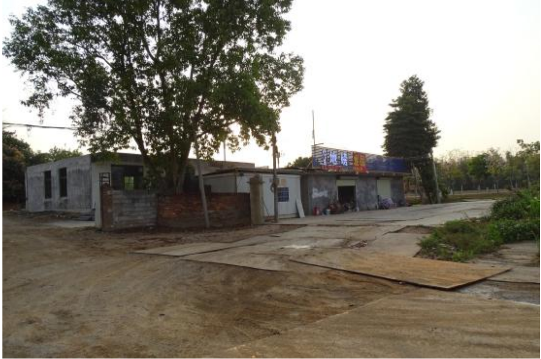
图 26 工程用地北部地表现状（北-南）