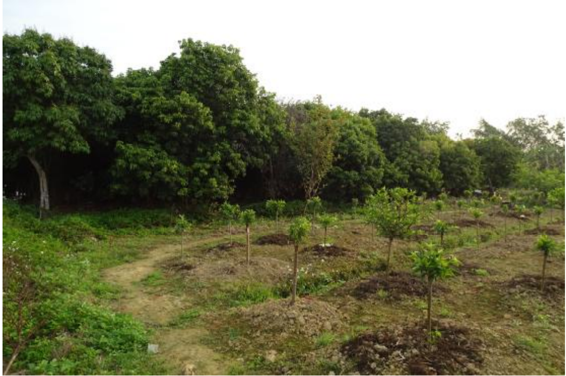
图 32 工程用地南部地表现状（南-北）