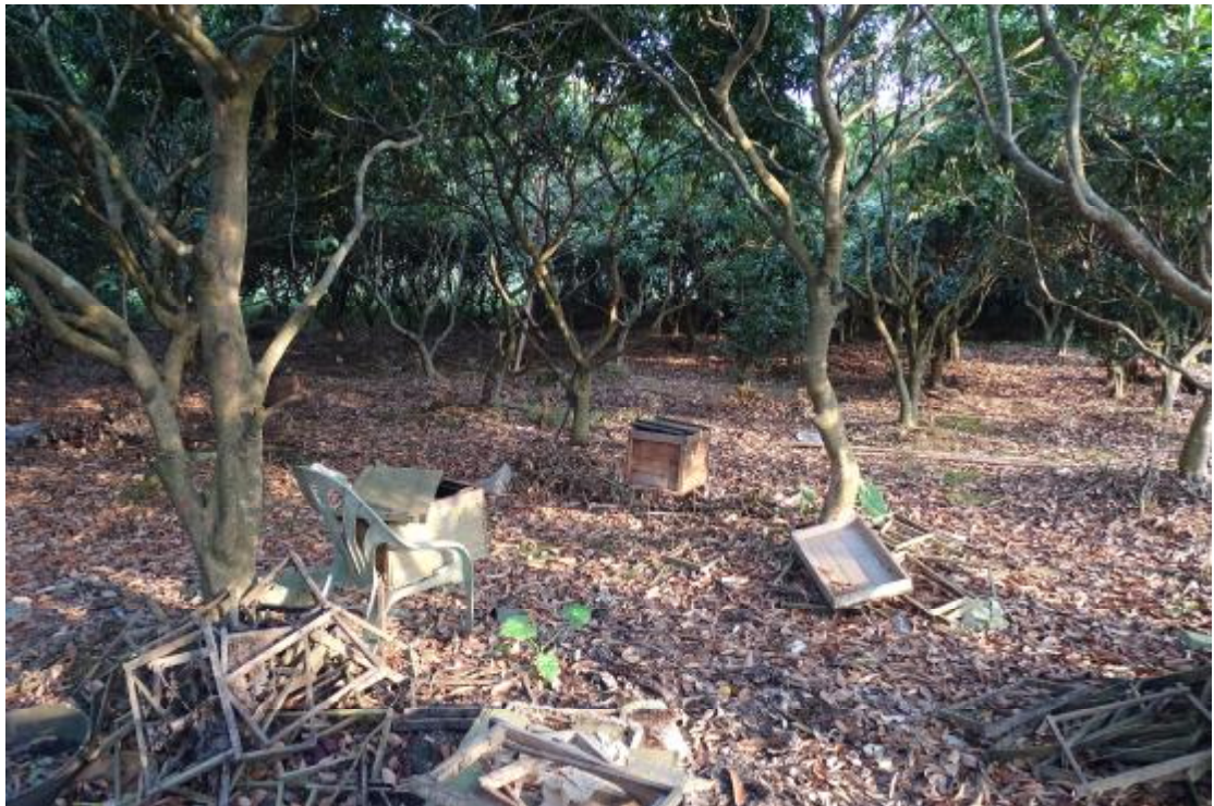
图 33 工程用地南部地表现状（南-北）