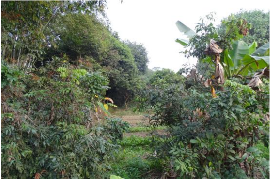
图 38 工程用地南部地表现状（南-北）