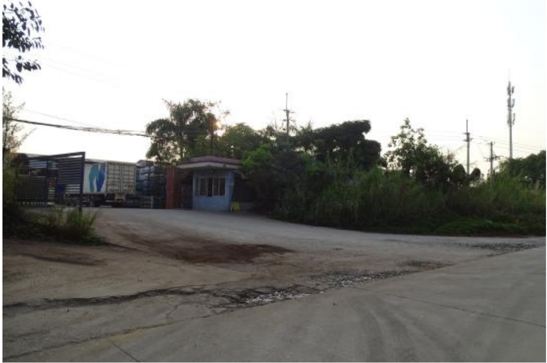
图 22 工程用地北部地表现状（北-南）