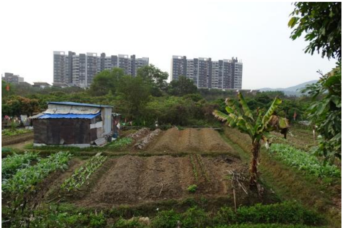
图 41 工程用地南部地表现状（北-南）