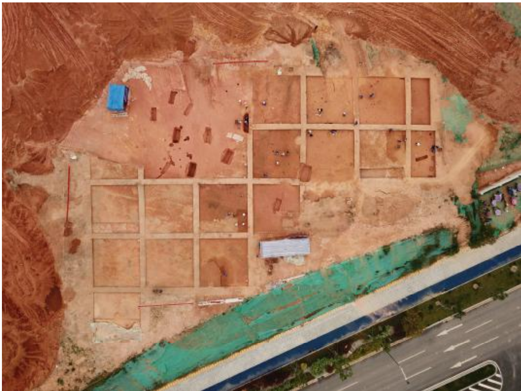
图 6 沙岭遗址 2020 年 10 月 14 日航拍照（上东下西）

2024年1月，对知识城知识五路市政道路及配套设施工程进行了考古调查，未发现古代文化遗存。