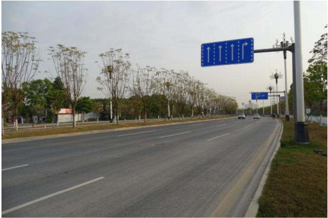
图 28 工程用地北部地表现状（西-东）