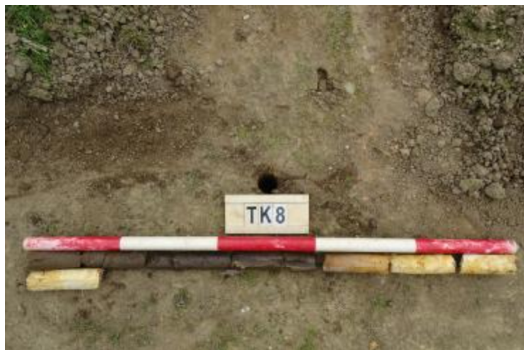
图 65 TK8 土样 (一米标杆, 土样由左上往右下)

①层: 现代回填土层, 距地表深约 0-0.6 米, 厚约 0.6 米, 为黑褐色黏土, 土质疏松, 含植物根系等; 以下为黄褐色风化黏土, 土质致密、纯净, 系生土。