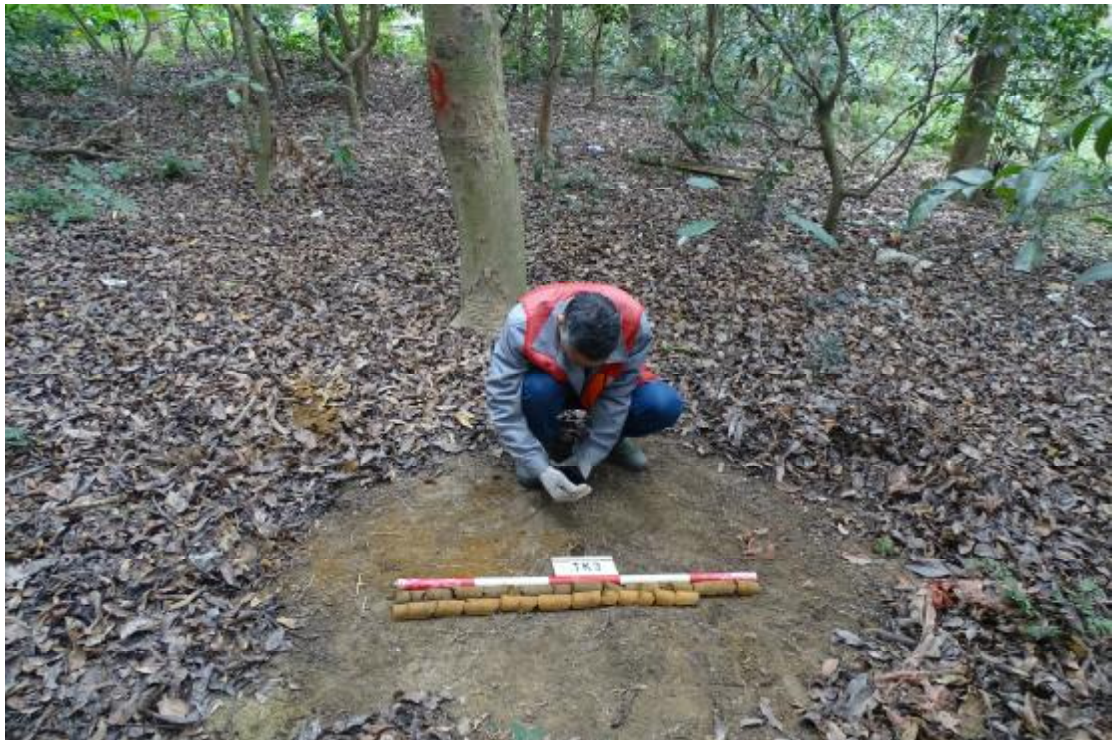
图 57 试探孔坐标测量（西-东）