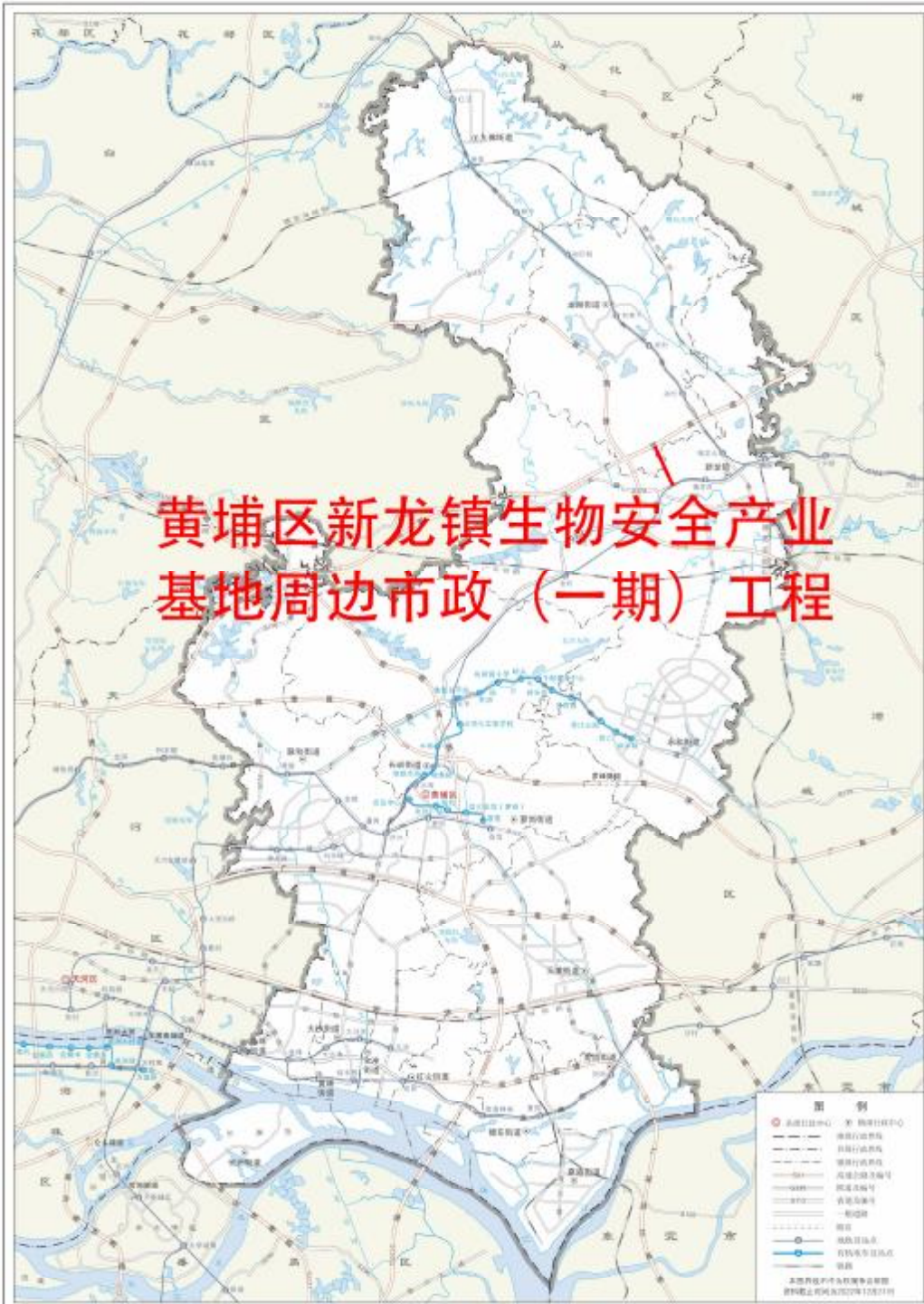
图 2 工程用地在黄埔区位置示意图（广州市规划和自然资源局）