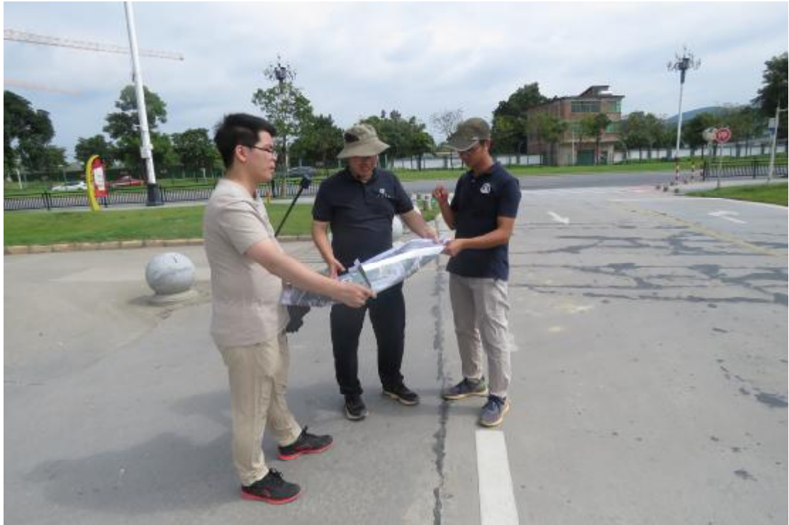
图 8 与现场工作人员确认工程用地范围（北-南）