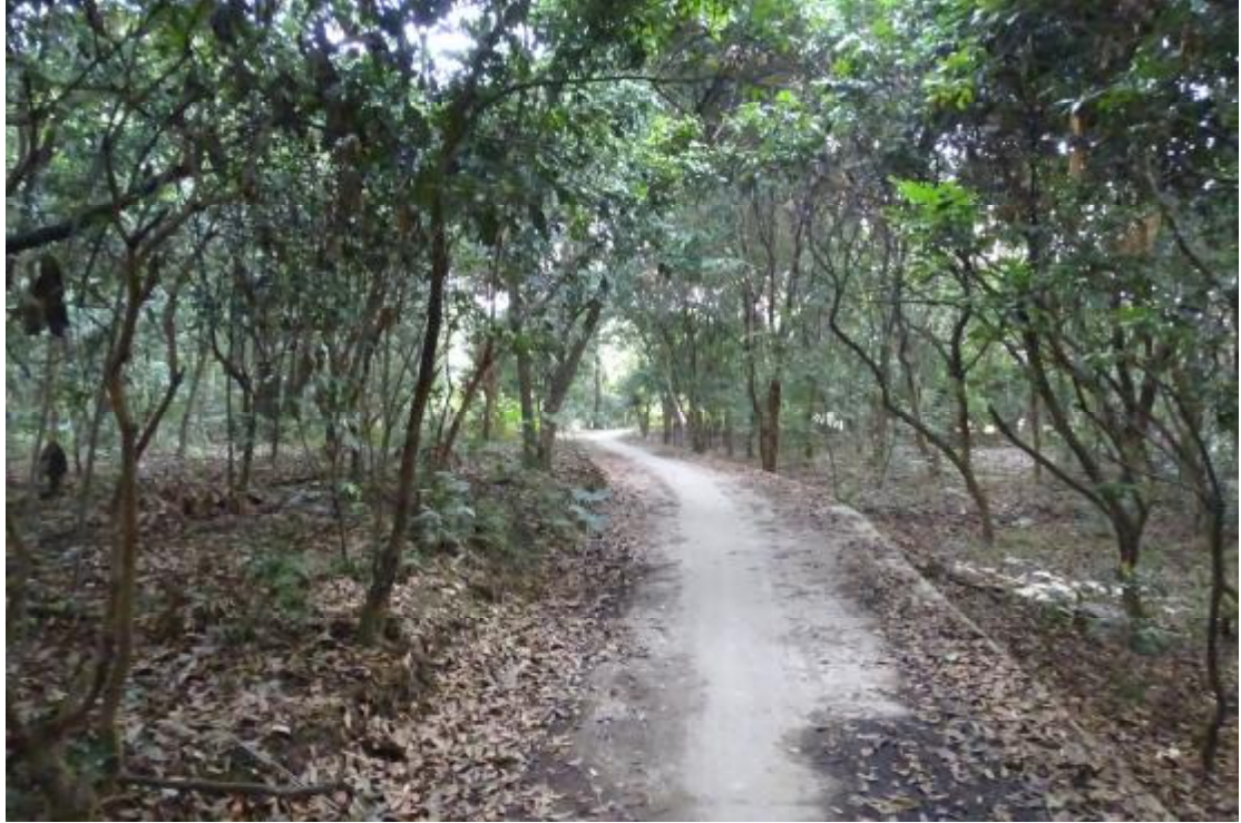
图 36 工程用地南部地表现状（西-东）