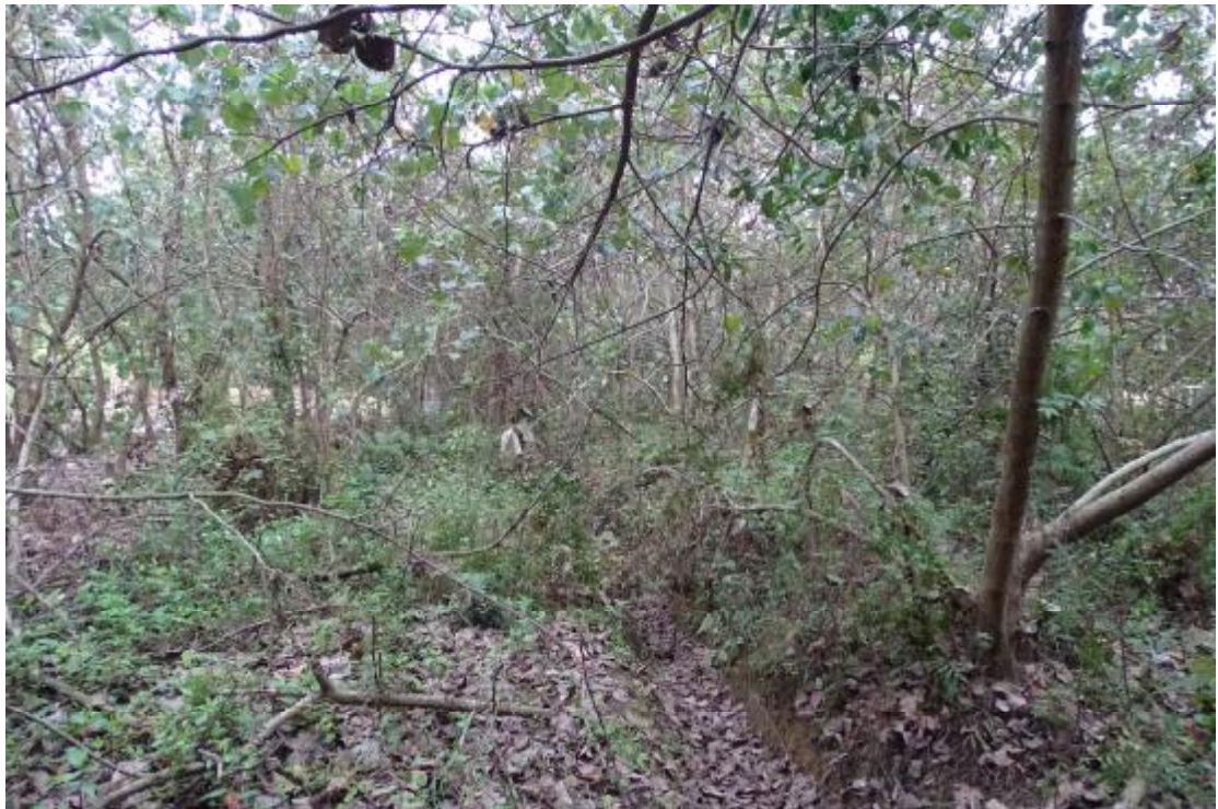
图 45 工程用地南部地表现状（东-西）