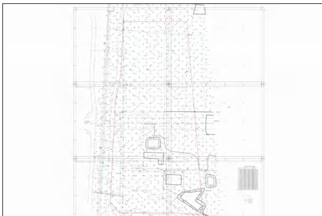
图 5 项目地块红线图