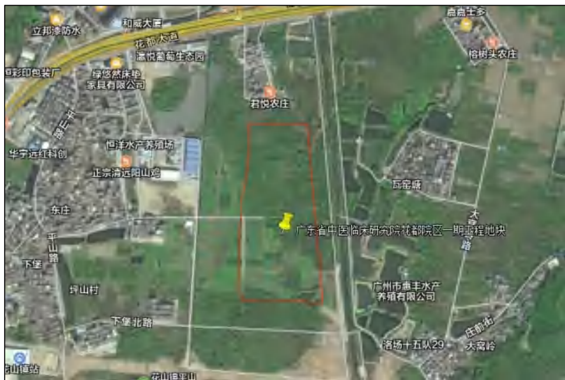
图 4 项目地块卫星影像图（腾讯卫星地图）