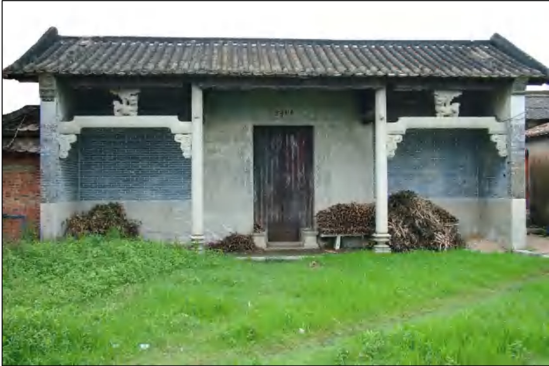
图 9 梁氏大宗祠

梁氏大宗祠 位于花山镇平山村联民自然村。始建年代不详，清同治六年（1867）重修。坐北朝南，三间三进，总面阔 11 米，总进深 23 米，建筑占地 264 平方米。2008 年 5 月，公布为花都区登记保护文物保护单位。