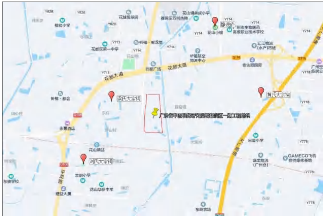
图 6 广东省中医临床研究院花都区一期工程地块周边不可移动文物分布示意图

该项目范围内未发现不可移动文物，周边有部分文物资源。根据《广州市文物普查汇编·花都区卷》，该项目周边的不可移动文物有黄氏大宗祠、刘氏大宗祠、梁氏大宗祠。