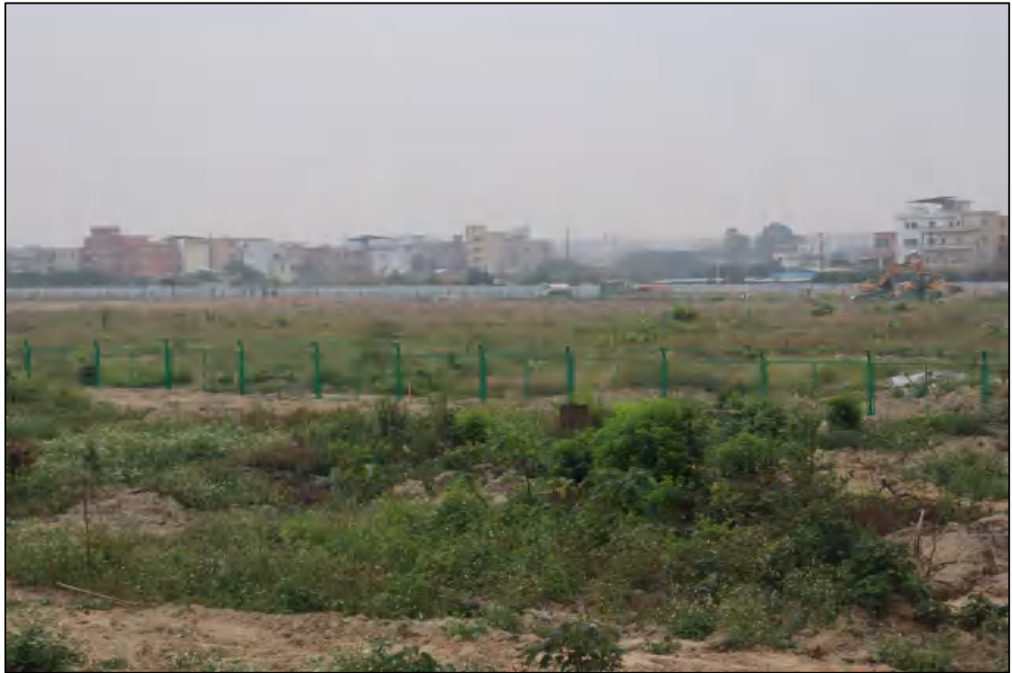
图 20 地块内部现状（东-西）