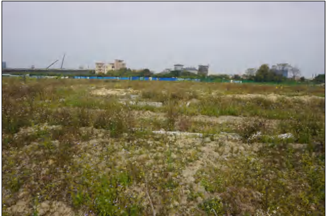
图 16 地块中南部现状（南-北）