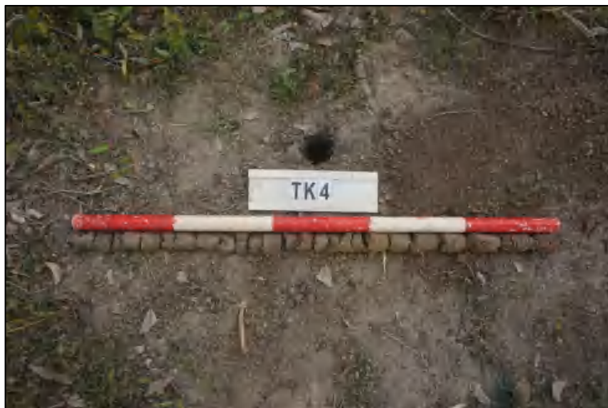
图 28 TK4 土样 (标杆长 1.0 米,土样由左到右)

①层: 表土层,距地表 0-1.0 米,厚约 1.0 米,灰黑褐色相间黏土,土质疏松,含有植物根茎、沙粒。勘探至 1.0 米遇沙石,土样无法提取。