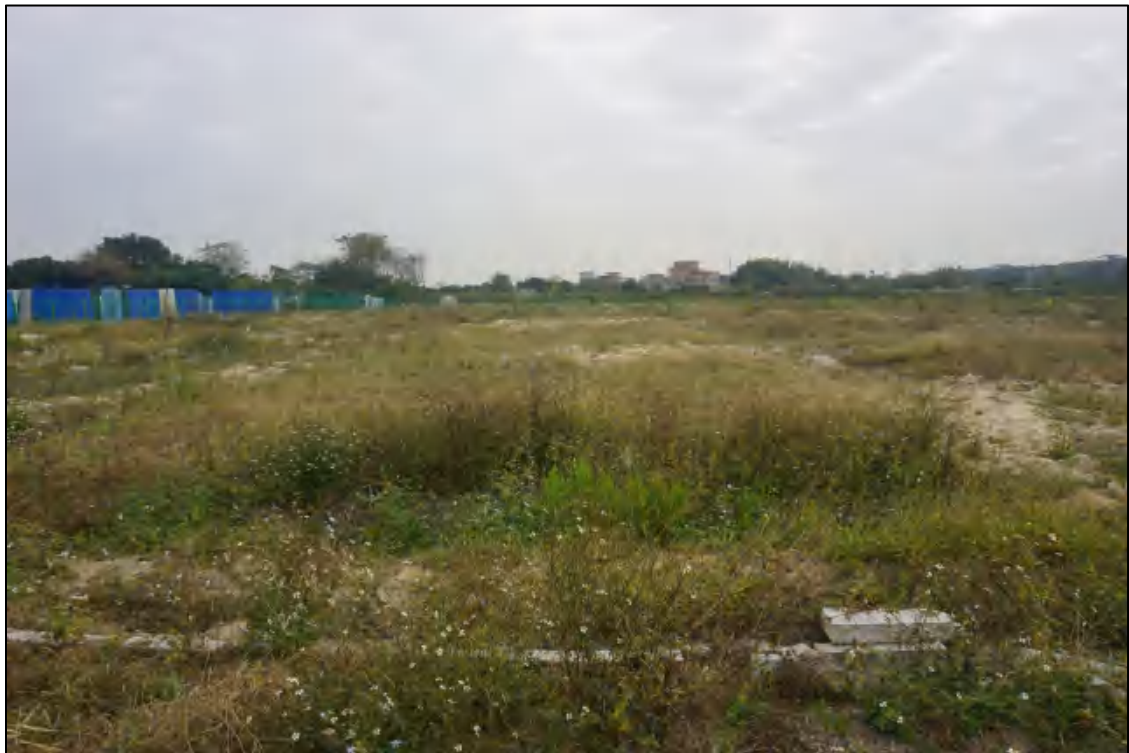
图 14 地块西北部现状（东-西）