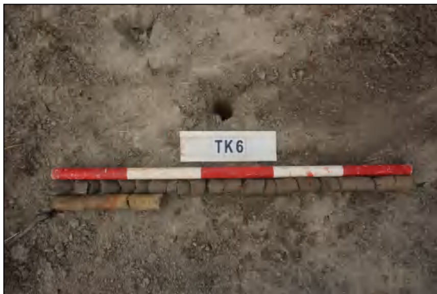
图 30 TK6 土样 (标杆长 1.0 米,土样由左上到右下)

①层: 表土层,距地表 0-1.0 米,厚约 1.0 米,灰黑褐色相间黏土,土质疏松,含有植物根茎、沙粒。该层下为生土,勘探深至 1.3 米,红黄褐色相间黏土,土质致密,纯净。