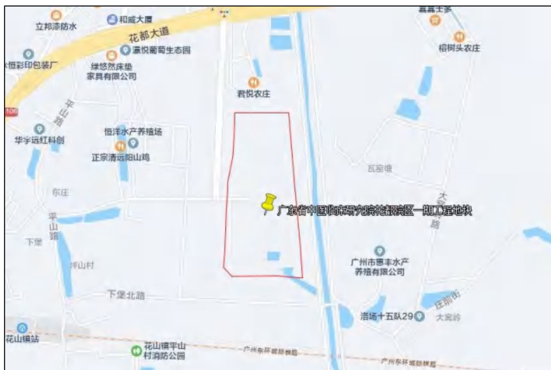
图 3 项目地块周边位置图（腾讯地图）