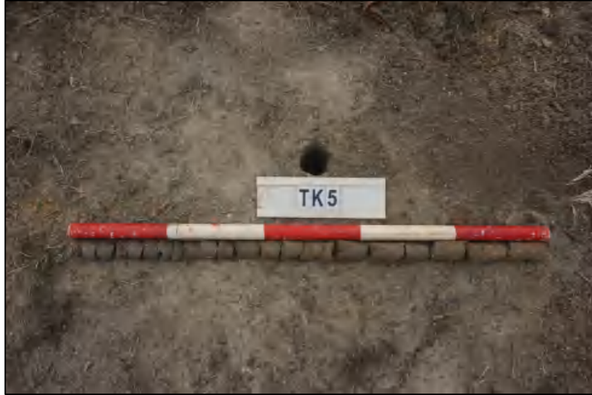
图 29 TK5 土样 (标杆长 1.0 米,土样由左到右)

①层: 表土层,距地表 0-1.0 米,厚约 1.0 米,灰黑褐色相间黏土,土质疏松,含有植物根茎、沙粒。勘探至 1.0 米遇沙石,土样无法提取。