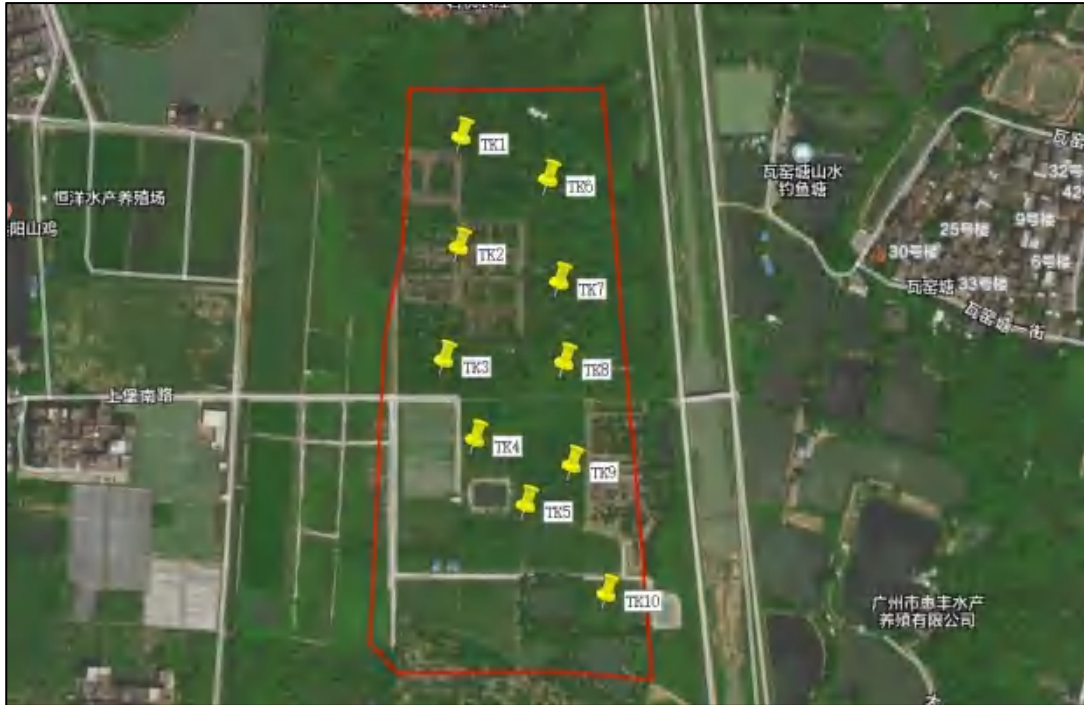
图 21 地块内试探探孔位置示意图（黄色标记点）

为了进一步掌握项目地块内的地层堆积情况，根据现场实际情况，我们在地块内布设 10 个试探探孔，分别编号为 TK1-TK10, 其具体情况如下：