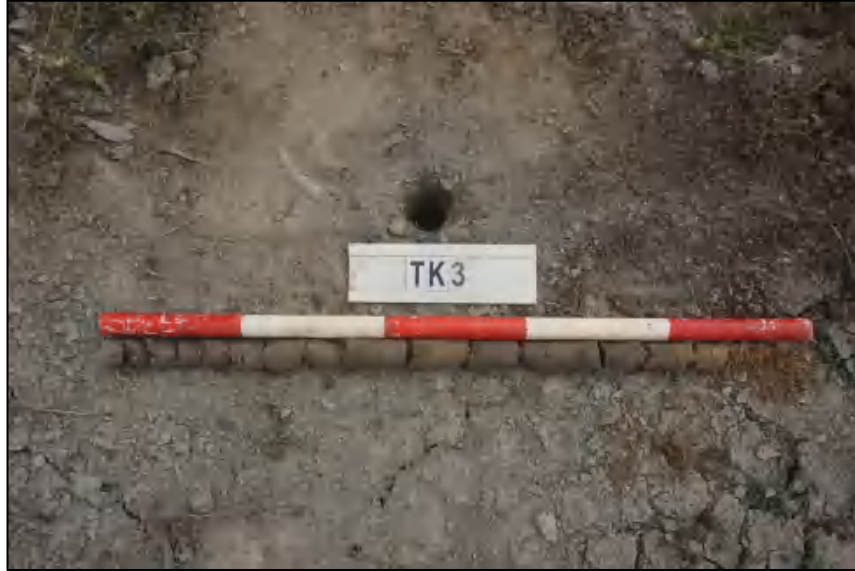
图 27 TK3 土样 (标杆长 1.0 米,土样由左到右)

①层: 表土层,距地表 0-1.0 米,厚约 1.0 米,灰黑褐色相间黏土,土质疏松,含有植物根茎、沙粒。勘探至 1.0 米遇沙石,土样无法提取。