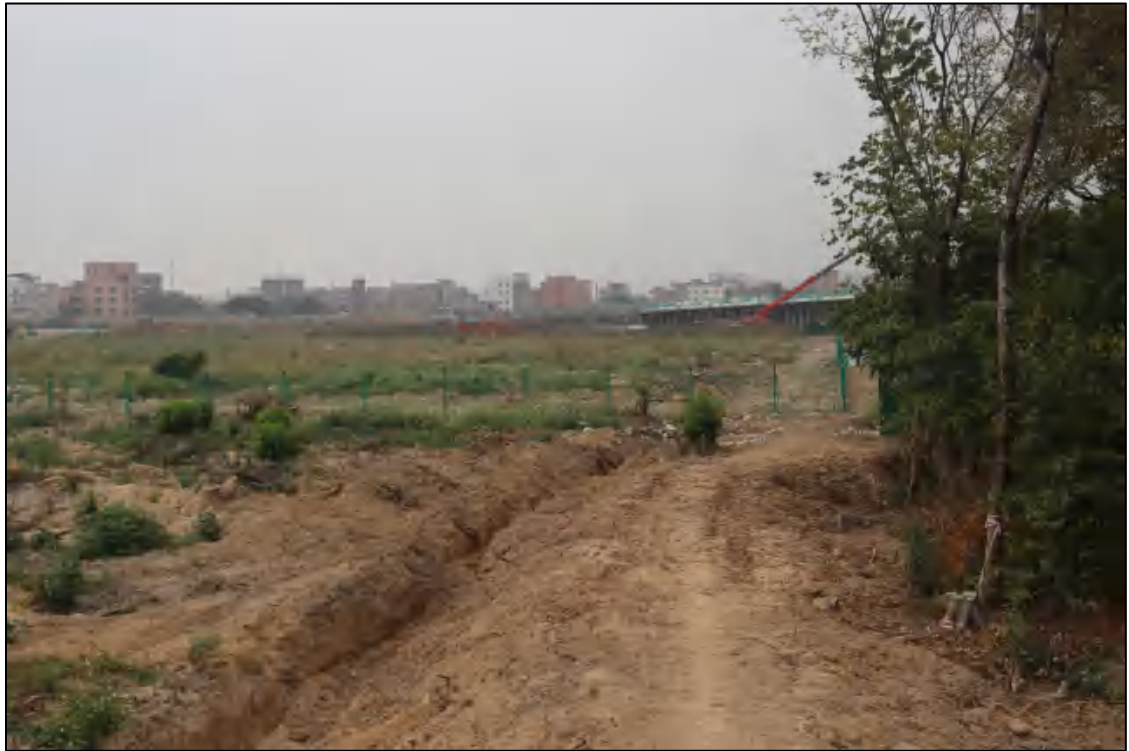
图 18 地块内部现状（东-西）