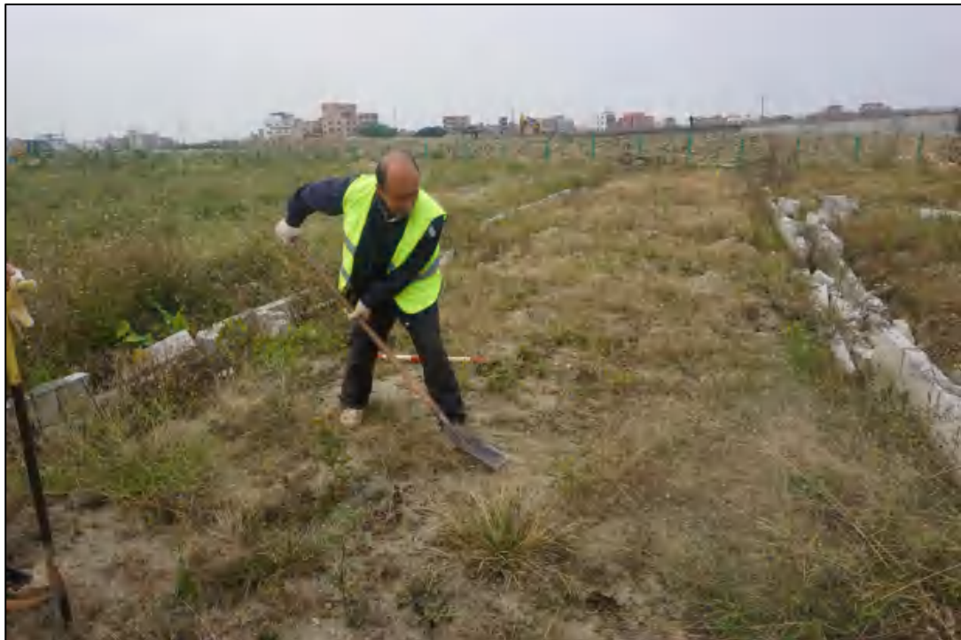
图 22 试探孔清表工作照（东-西）