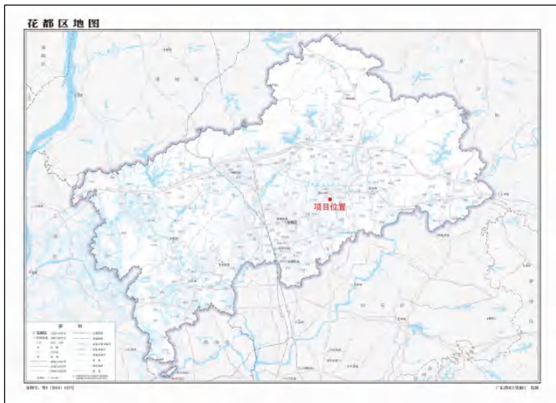
图 2 项目地块在花都区位置（广东省国土资源厅）