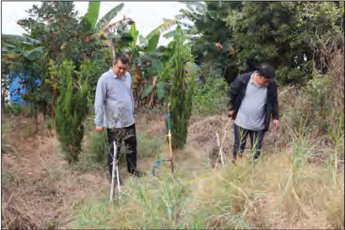
图 11 考古工作人员现场踏查（南-北）