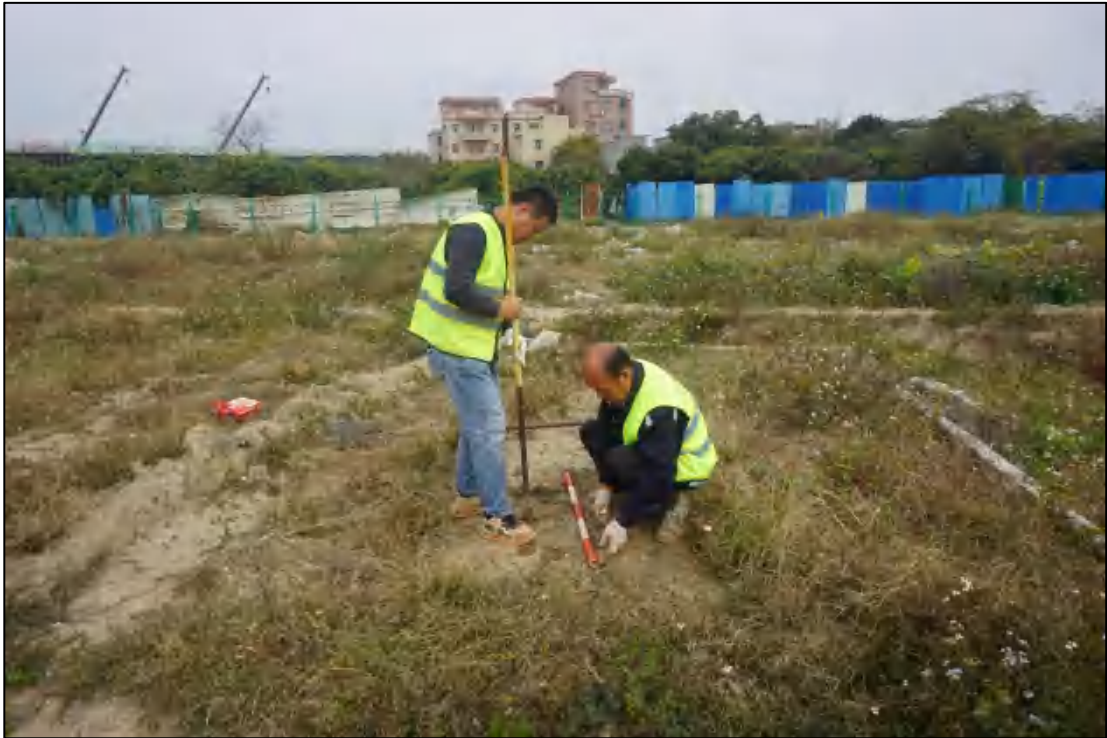
图 23 试探孔提取工作照（南-北）