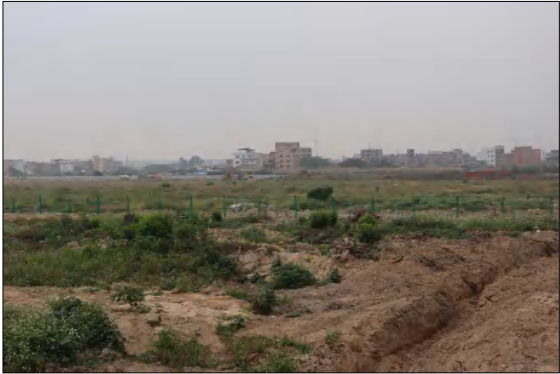
图 19 地块内部现状（东-西）