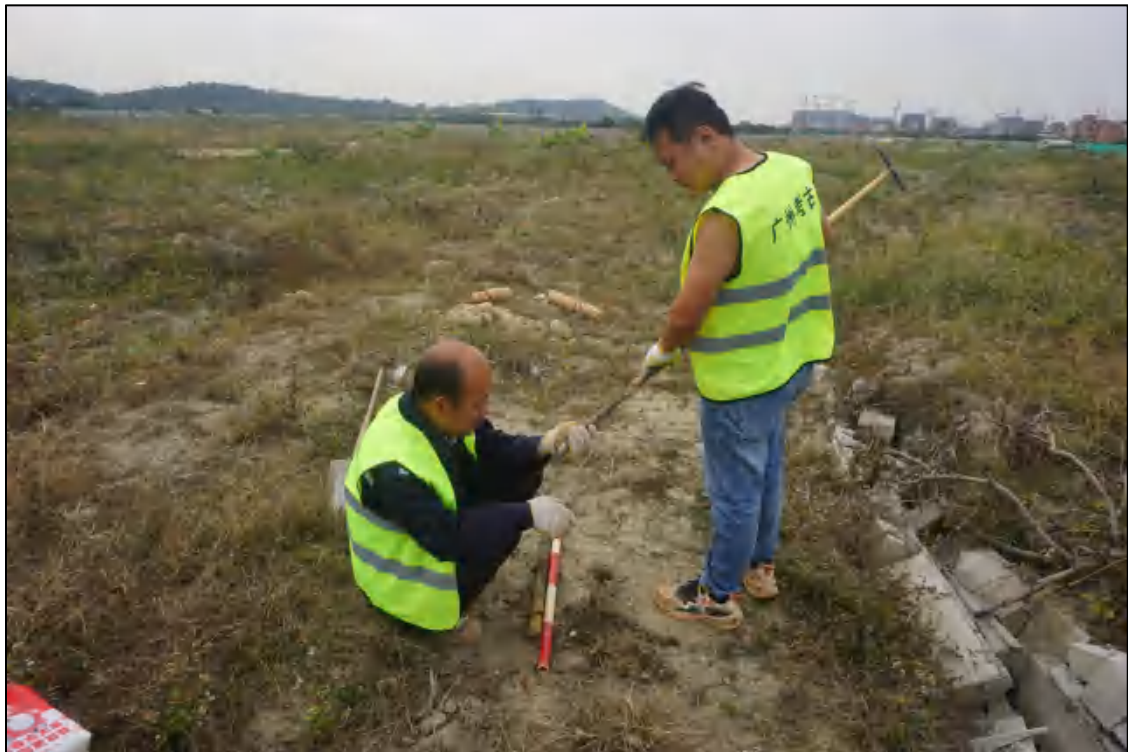
图 24 分析土样工作照（北-南）