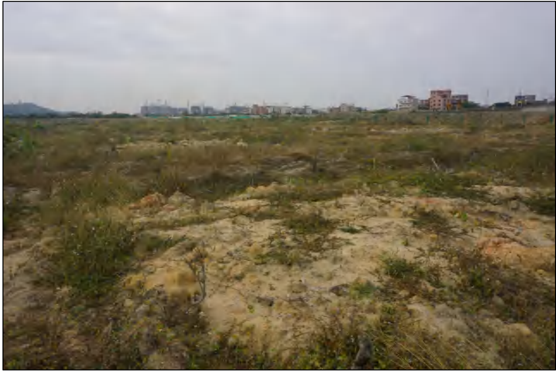
图 13 地块西北部现状（北-南）