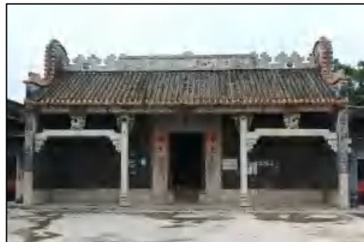
图 8 刘氏大宗祠