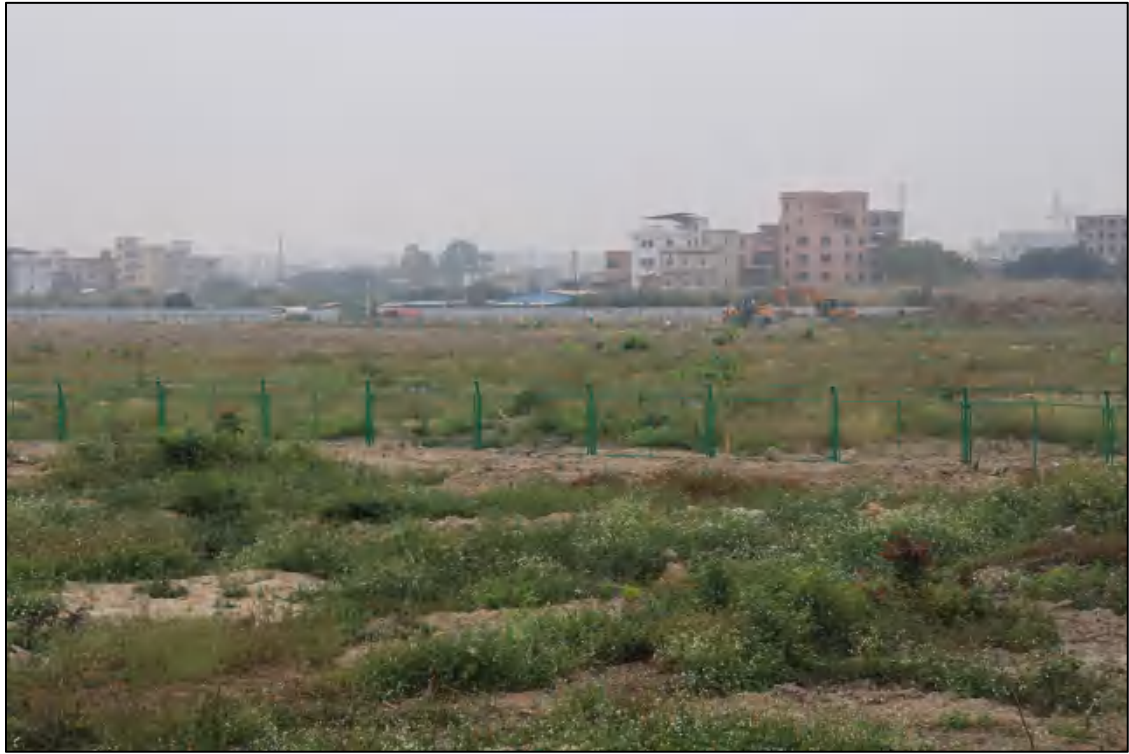
图 17 地块内部现状（东-西）