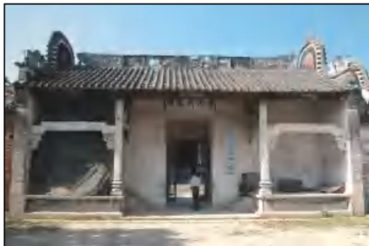
图 7 黄氏大宗祠

刘氏大宗祠 位于花山镇平山村东村。建于清光绪七年（1881），1986 年重修。坐北朝南，广三路，深两进，总面阔 13.4 米，总进深 24.7 米，建筑占地 341 平方米。2008 年 5 月，公布为花都区登记保护文物单位。