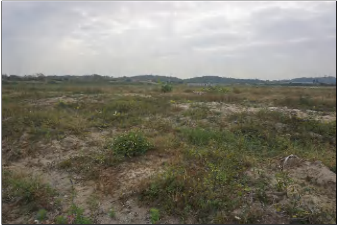
图 15 地块中部现状（北-南）