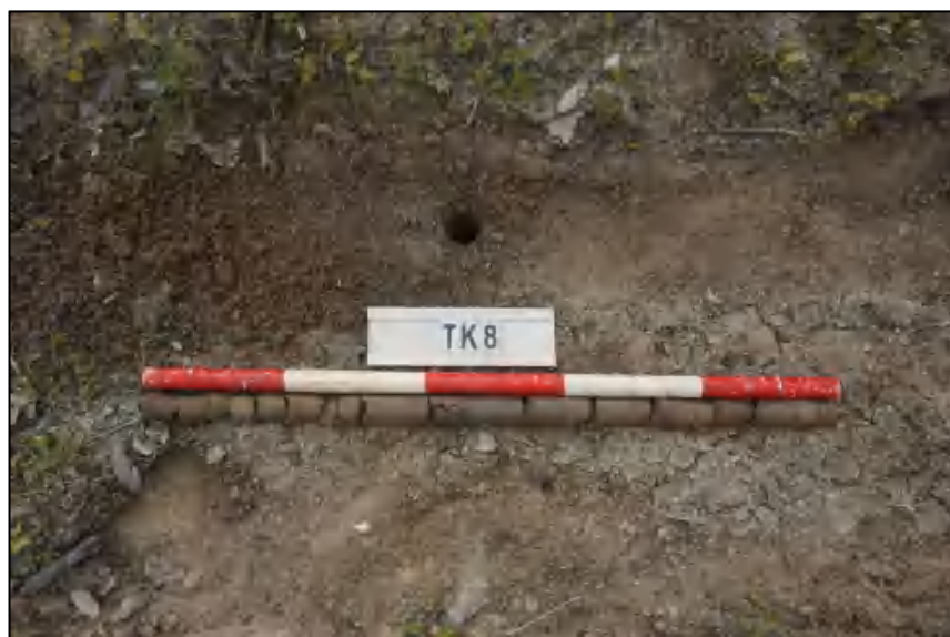
图 32 TK8 土样 (标杆长 1.0 米,土样由左到右)

①层: 表土层,距地表 0-1.0 米,厚约 1.0 米,灰黑褐色相间黏土,土质疏松,含有植物根茎、沙粒。勘探至 1.0 米遇沙石,土样无法提取。