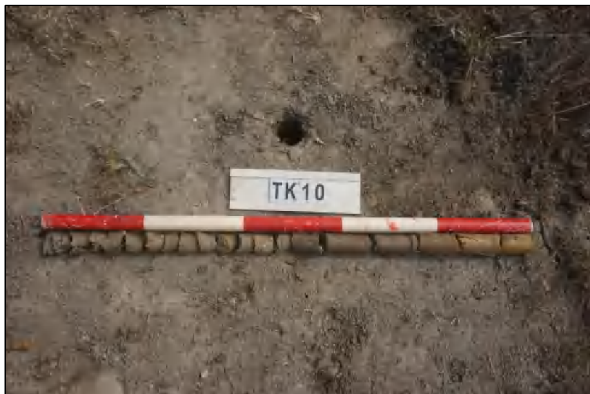
图 34 TK10 土样 (标杆长 1.0 米, 土样由左到右)

①层: 表土层, 距地表 0-0.5 米, 厚约 0.5 米, 浅褐色黏土, 土质疏松, 含有植物根茎、沙粒。该层下为生土, 勘探深至 1.0 米, 灰黄褐色相间黏土, 土质致密, 纯净。