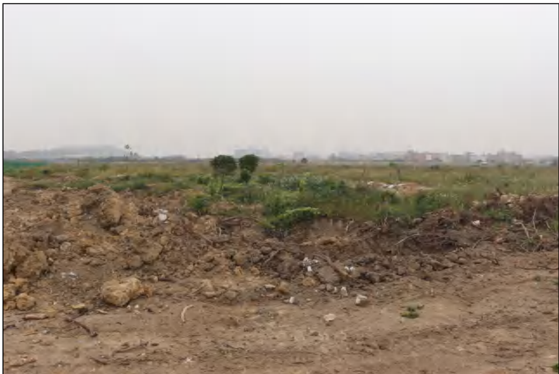
图 12 地块内部现状（北-南）