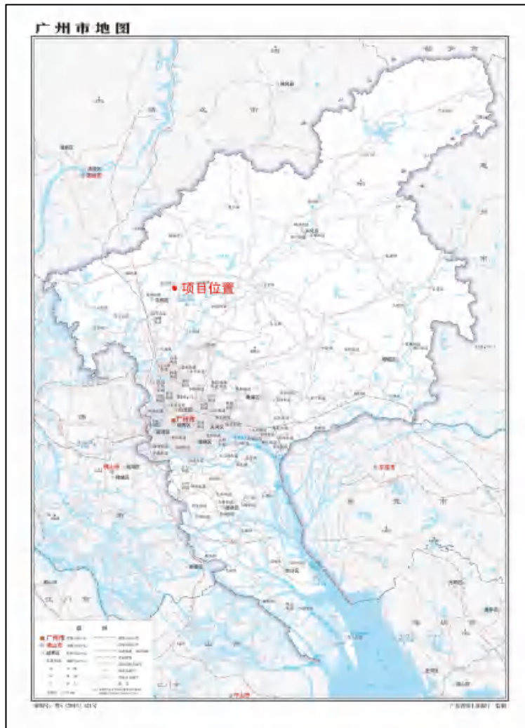
图 1 项目地块在广州市位置（广东省国土资源厅）

根据《中华人民共和国文物保护法》《广州市文物保护规定》，按照《广州市文物局关于广东省中医临床研究院花都院区一期工程地块考古调查勘探工作的复函》（文物 20231414 号）指导意见，受广州中医药大学附属第一医院委托，由我院负责该项目的文物考古调查工作。