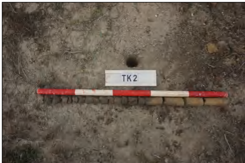
图 26 TK2 土样 (标杆长 1.0 米,土样由左到右)

①层: 表土层,距地表 0-0.6 米,厚约 0.6 米,灰黑褐色相间黏土,土质疏松,含有植物根茎、沙粒。该层下为生土,勘探深至 1.0 米,黄褐色黏土,土质致密,纯净。