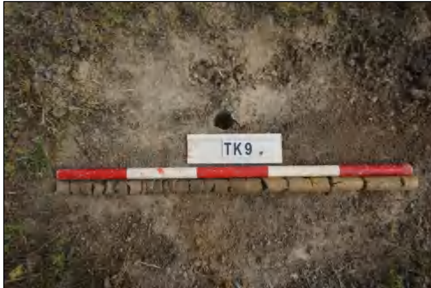
图 33 TK9 土样 (标杆长 1.0 米, 土样由左到右)

①层: 表土层, 距地表 0-0.5 米, 厚约 0.5 米, 灰黑褐色相间黏土, 土质疏松, 含有植物根茎、沙粒。该层下为生土, 勘探深至 1.0 米, 红黄褐色相间黏土, 土质致密, 纯净。