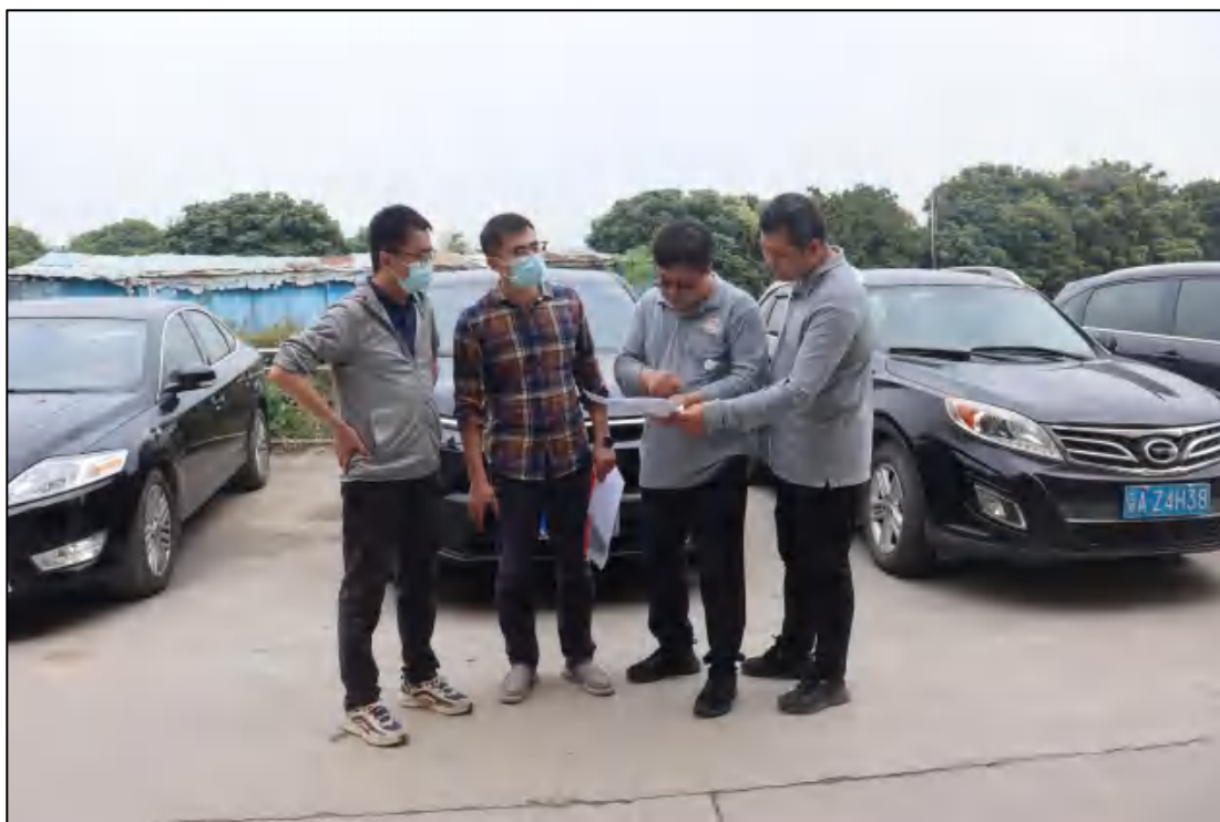
图 10 考古工作人员现场查看图纸（西-东）