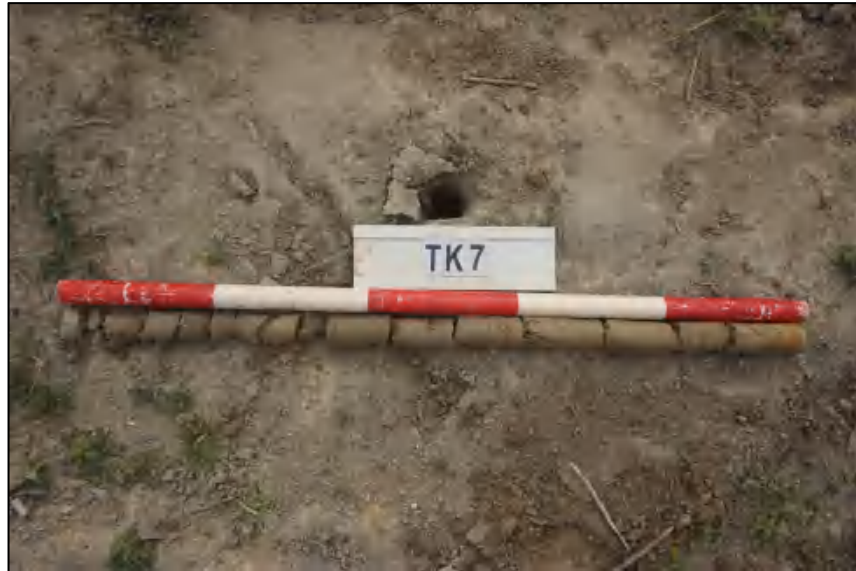
图 31 TK7 土样 (标杆长 1.0 米,土样由左到右)

①层: 表土层,距地表 0-0.6 米,厚约 0.6 米,灰褐色黏土,土质疏松,含有植物根茎、沙粒。该层下为生土,勘探深至 1.0 米,黄褐色黏土,土质致密,纯净。