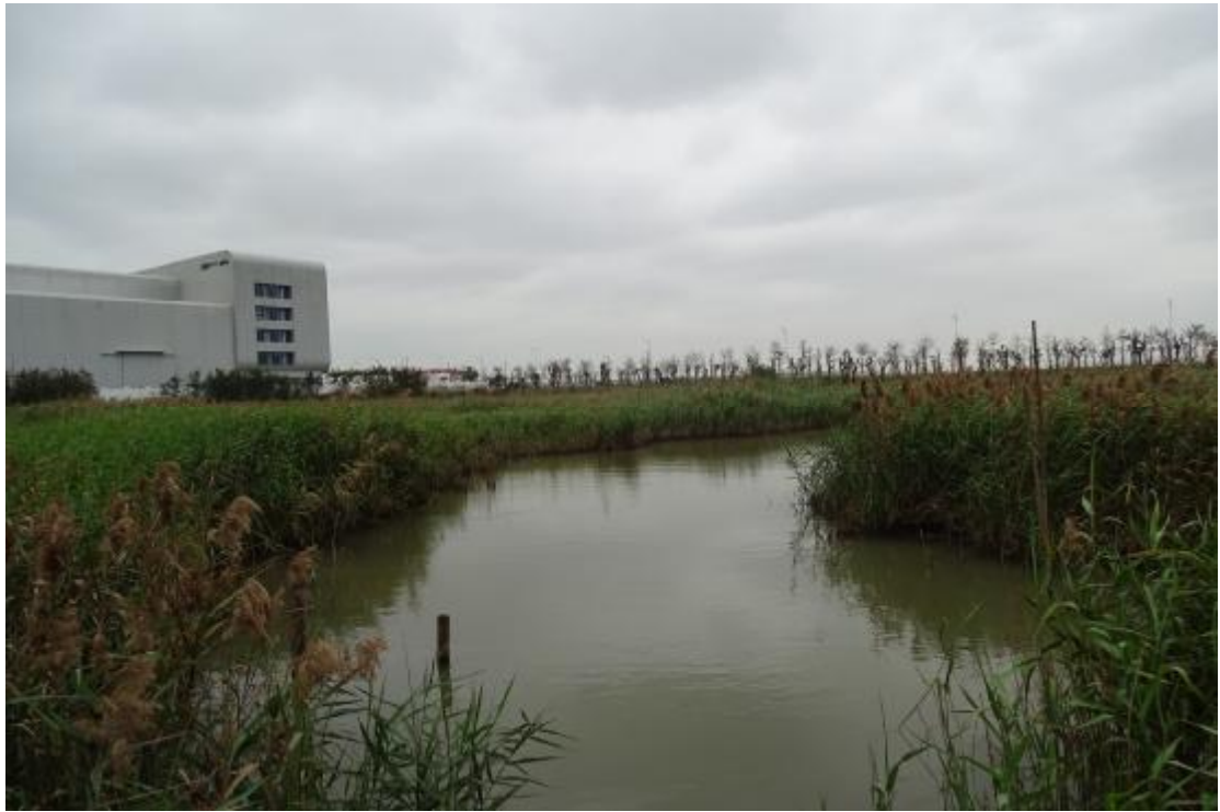
图 23 工程用地地表现状（西-东）