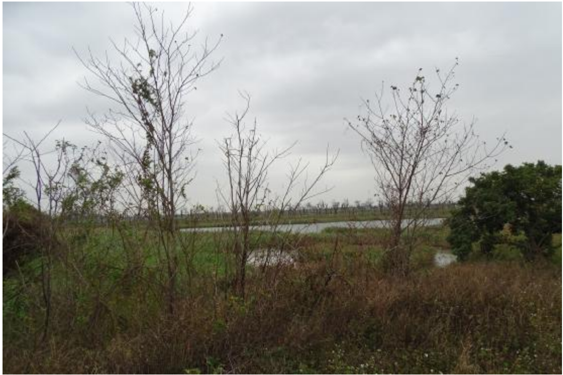
图 17 工程用地地表现状（北-南）