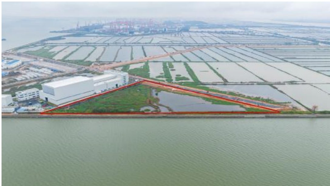
图 9 工程用地航拍示意图（上南下北）