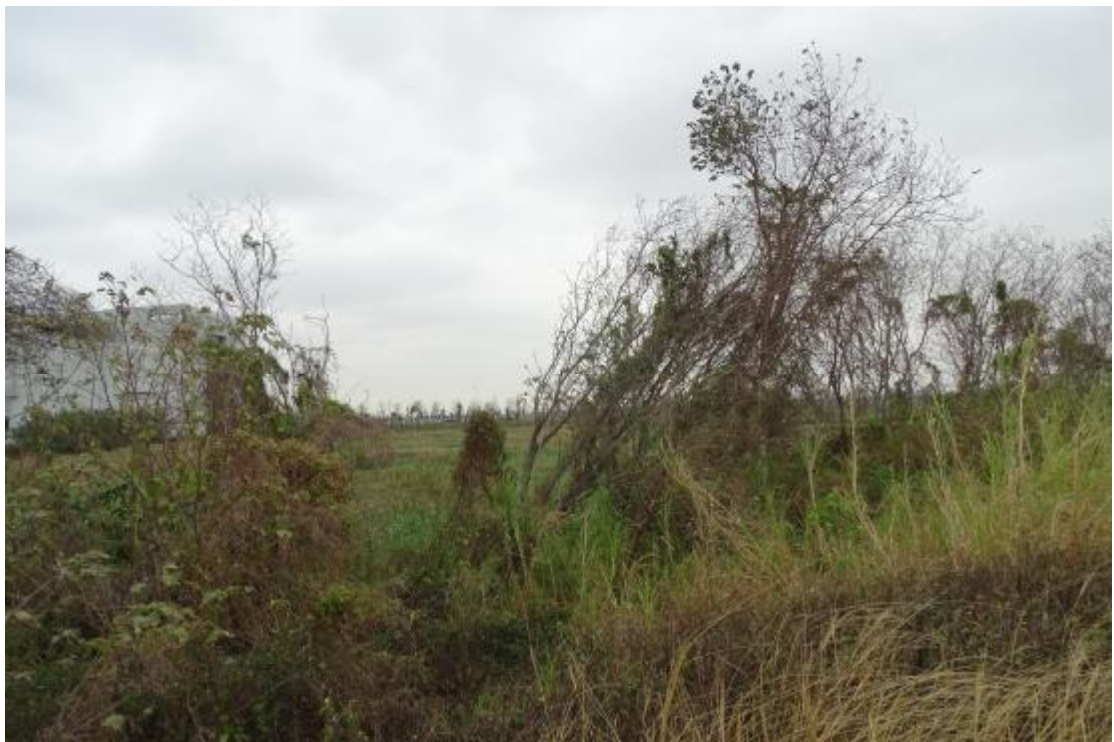
图 16 工程用地地表现状（北-南）