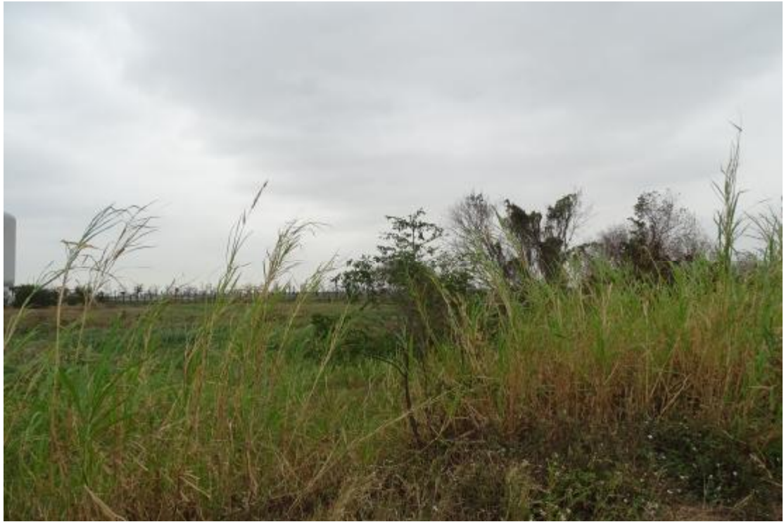
图 15 工程用地地表现状（北-南）