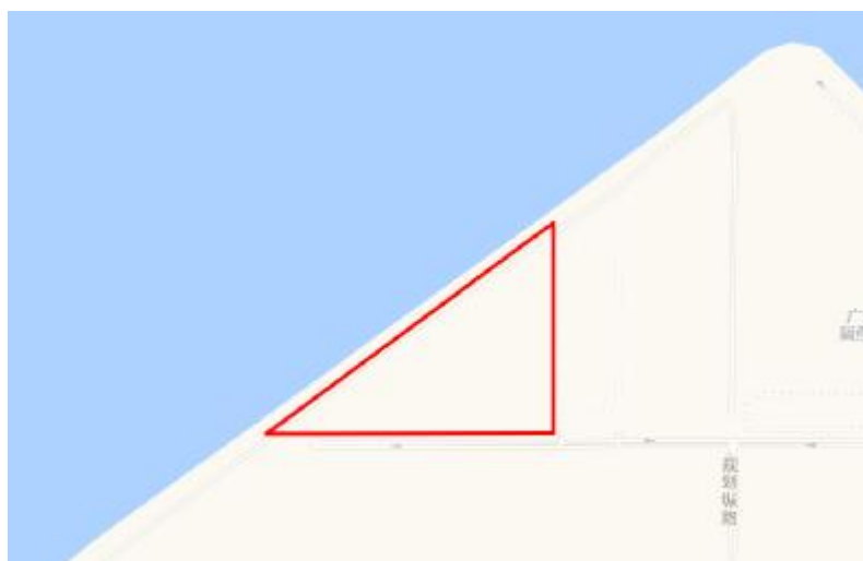
图 4 工程用地卫星红线示意图