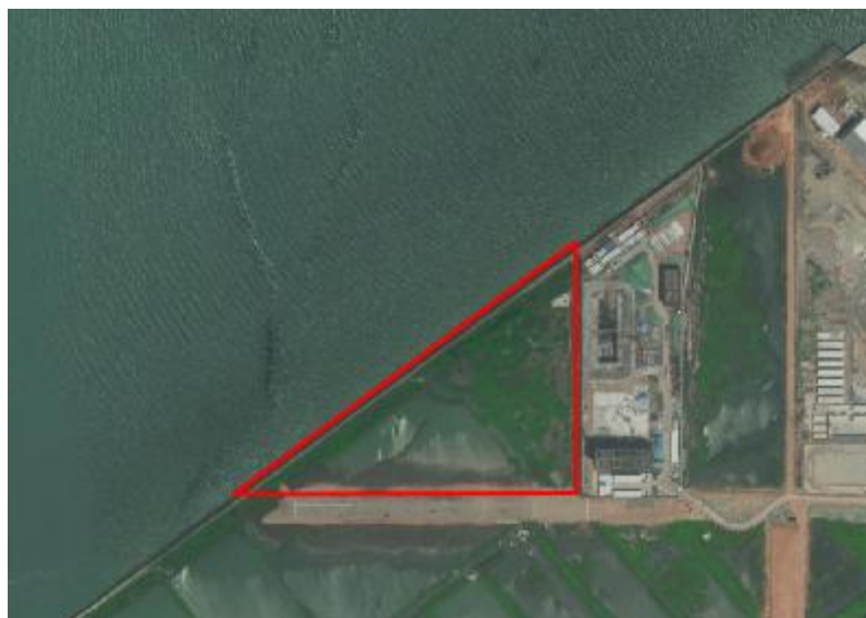
图 3 工程用地卫星红线示意图（腾讯地图）