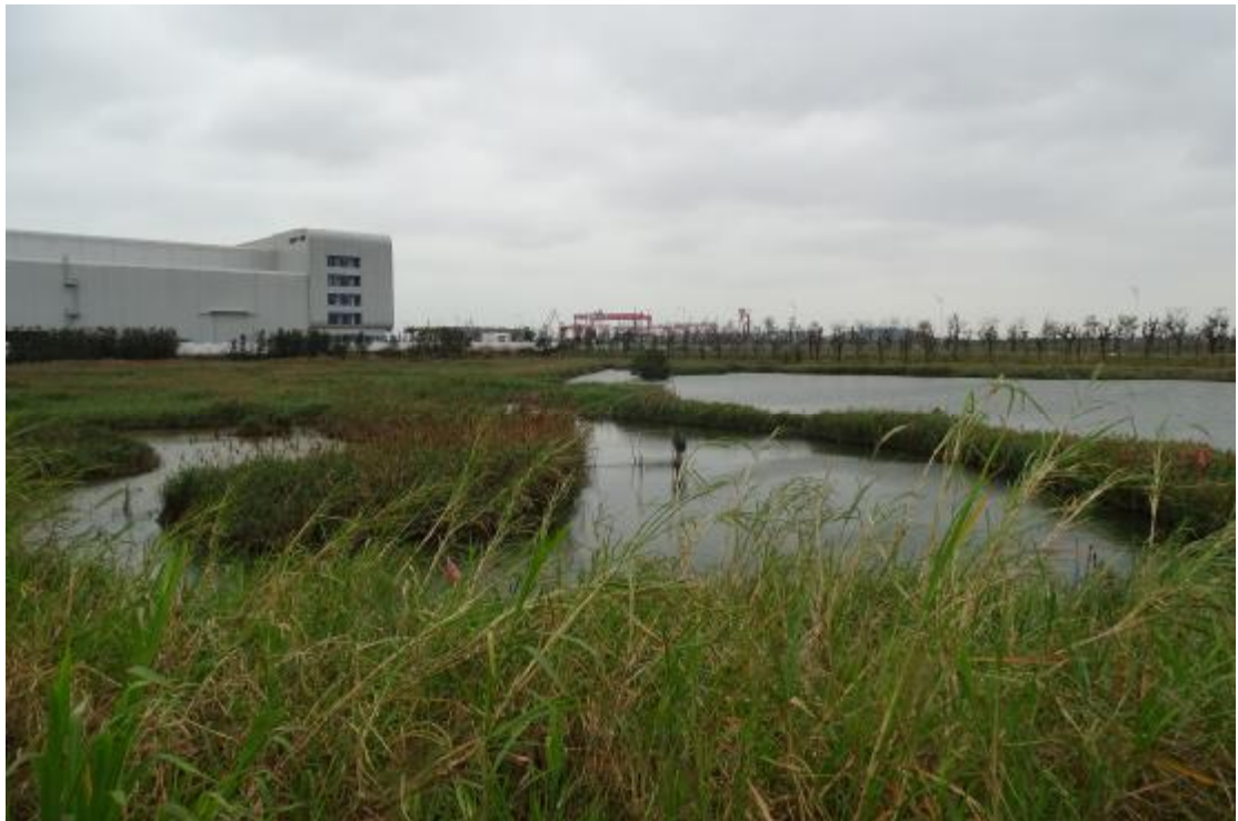
图 26 工程用地地表现状（西-东）