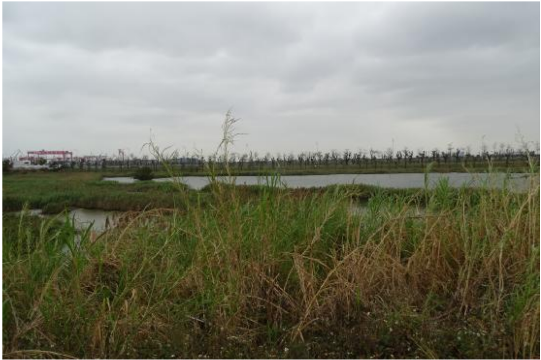
图 25 工程用地地表现状（北-南）