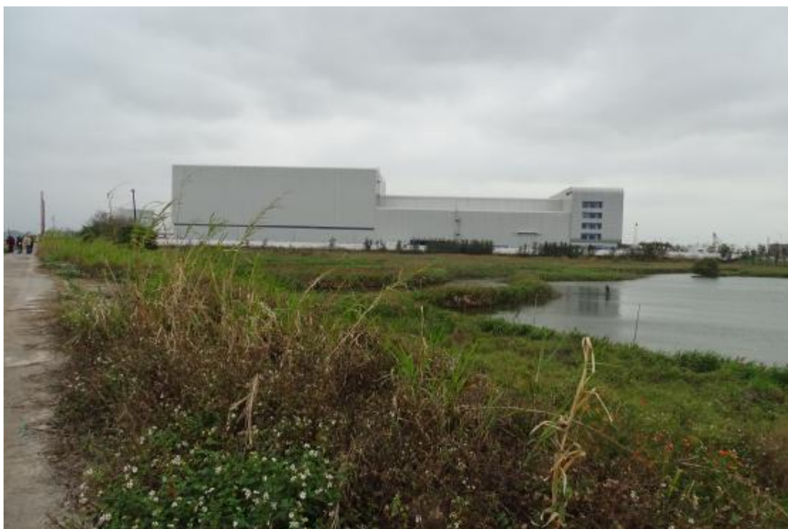
图 30 工程用地地表现状（西-东）