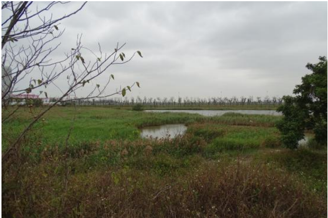
图 18 工程用地地表现状（北-南）