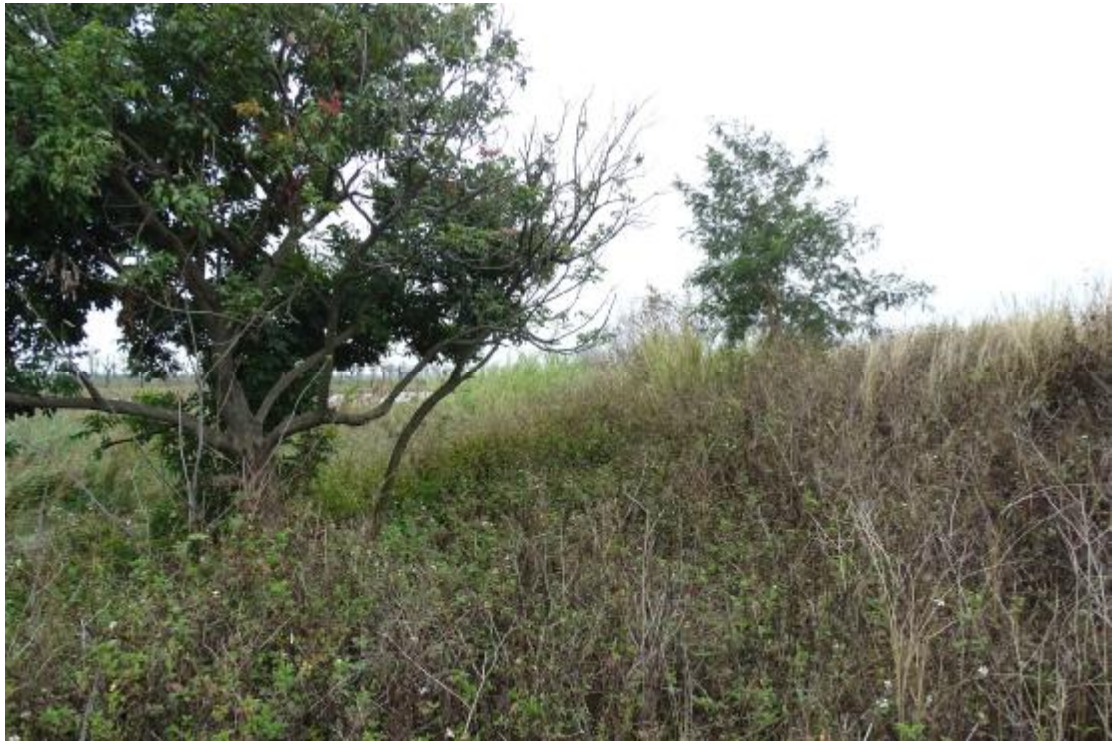
图 19 工程用地地表现状（东-西）