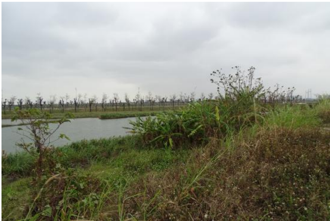
图 29 工程用地地表现状（东-西）