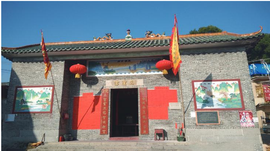
图 5 三圣宫

三圣宫： 位于广州市南沙区龙穴街道龙穴路二巷3号左边。相传始建于明代，清光绪元年（1875）重建，现存建筑于1984年重建。此宫坐西北向东南，三间两进，占地面积约为184.50平方米。2013年4月，被公布为南沙区登记保护文物保护单位。