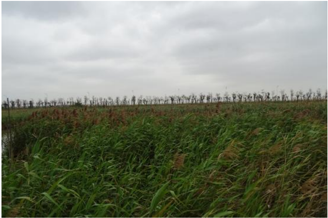
图 21 工程用地地表现状（北-南）