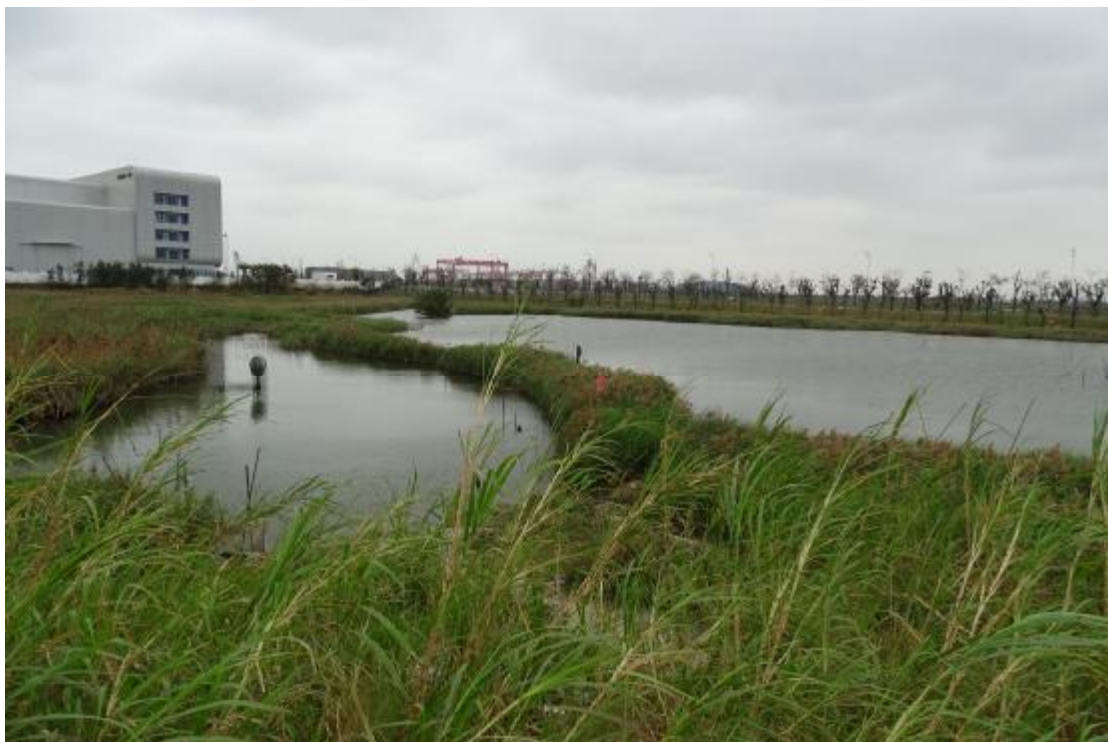
图 28 工程用地地表现状（西-东）