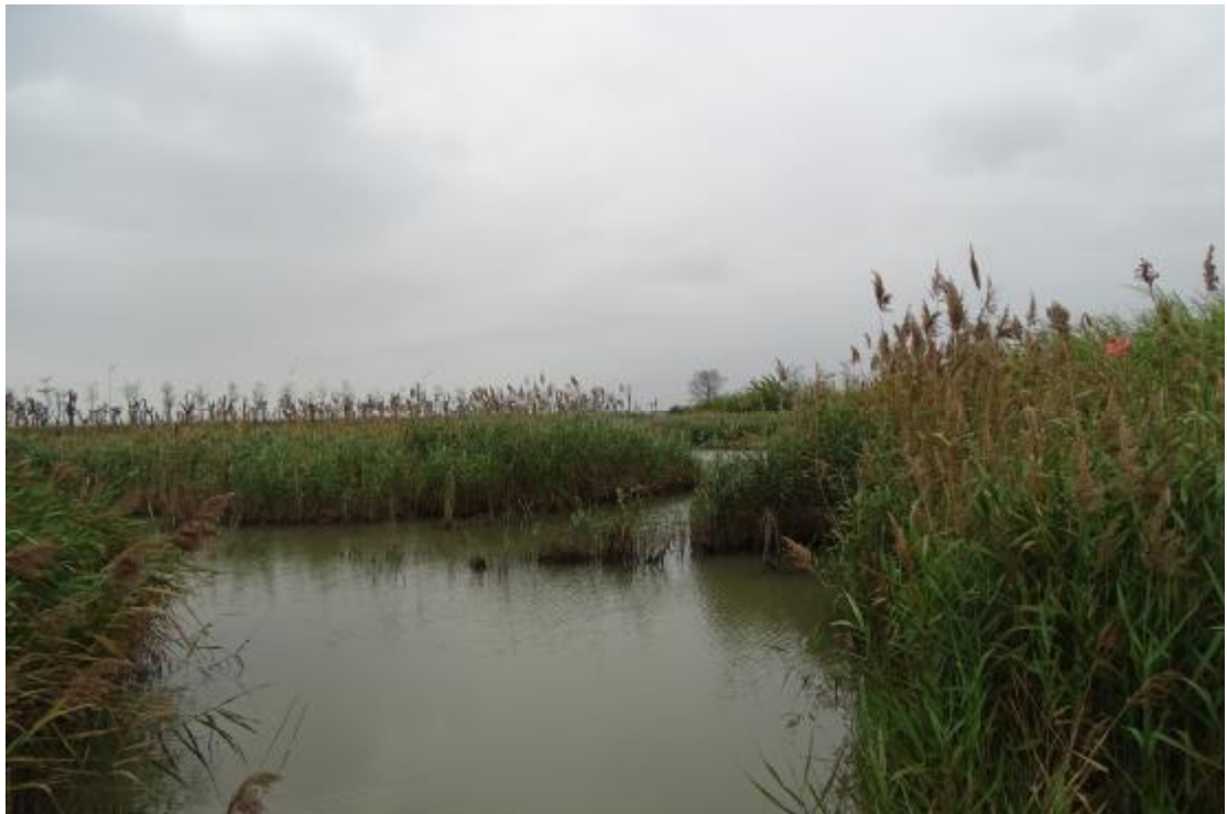
图 20 工程用地地表现状（北-南）