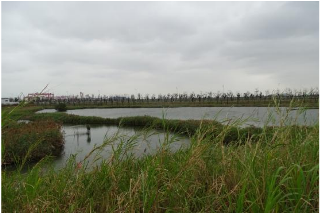
图 12 工程用地地表现状（北-南）