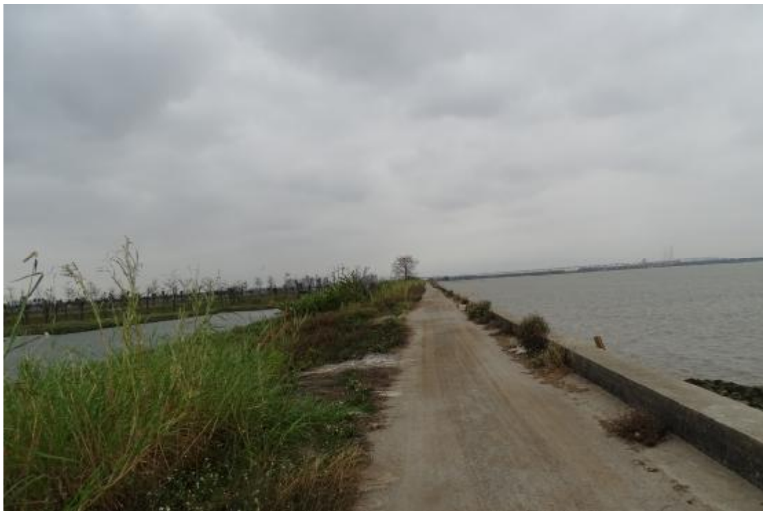
图 27 工程用地地表现状（东-西）