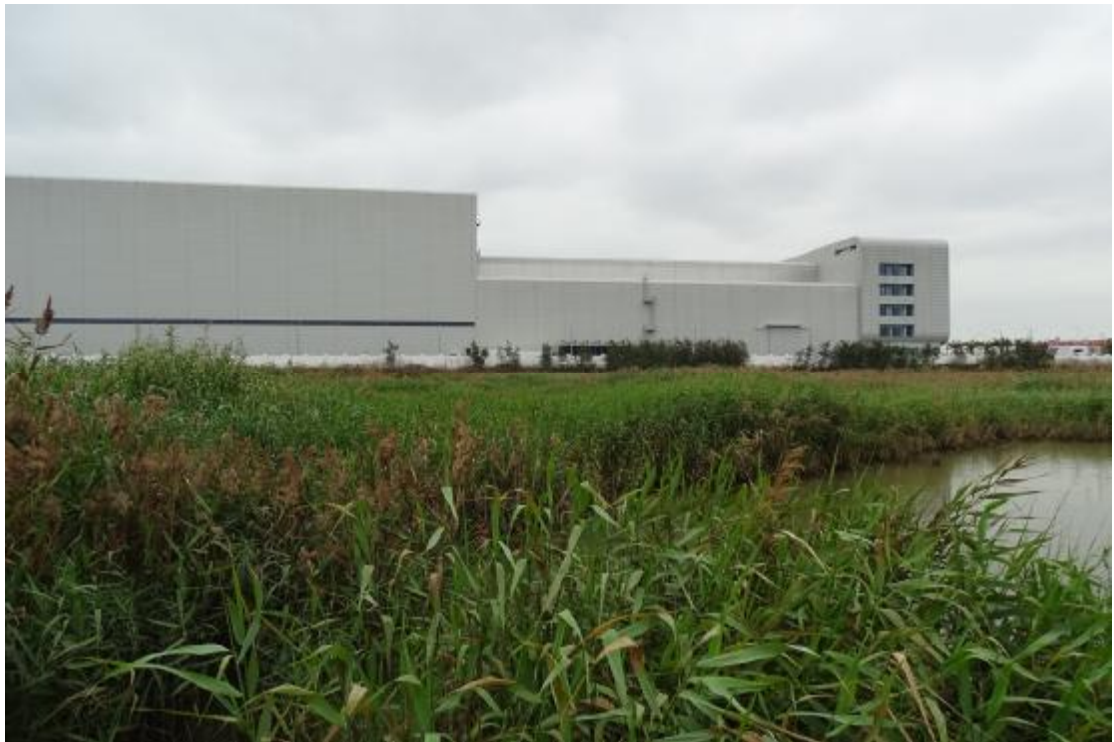
图 22 工程用地地表现状（西-东）