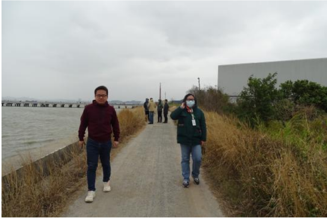
图 8 对工程用地地表进行踏查（西-东）