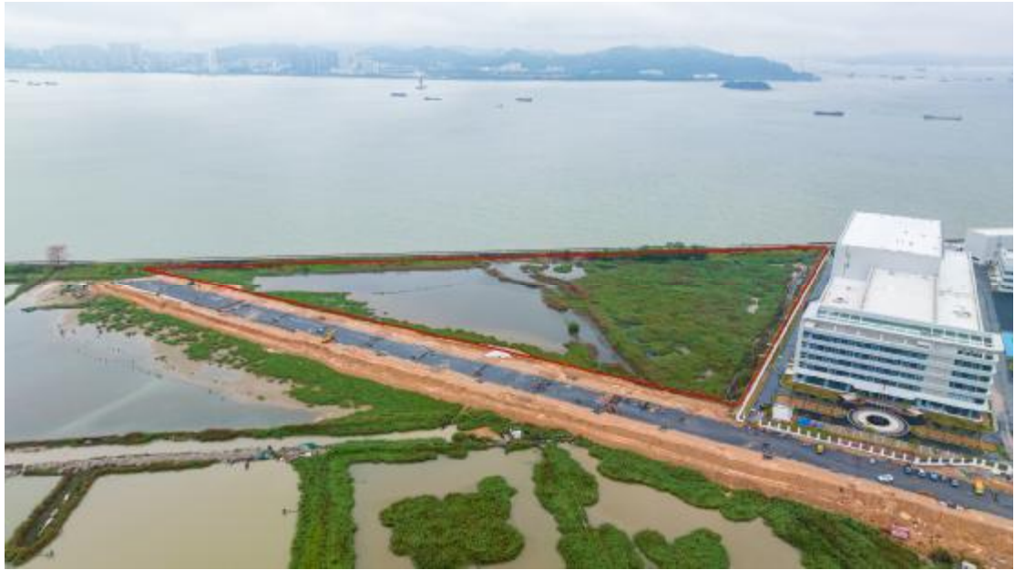
图 11 工程用地航拍示意图（上北下南）