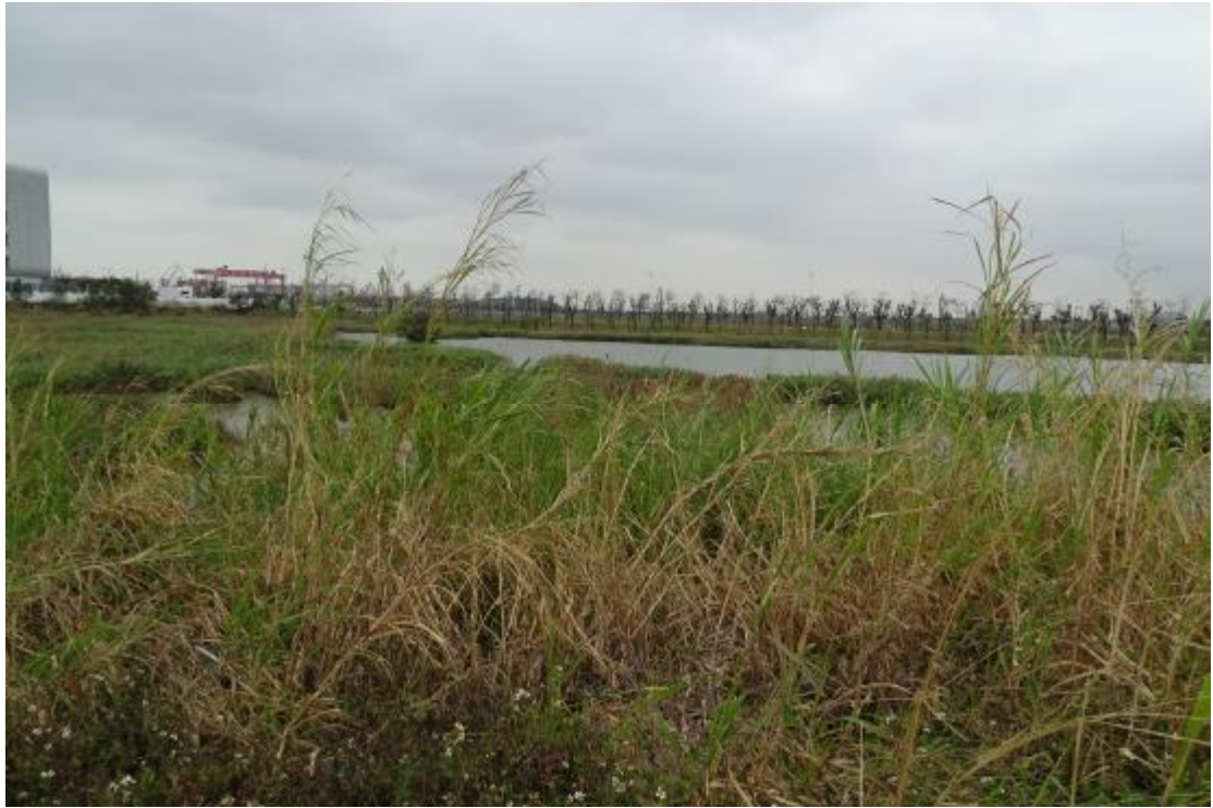
图 31 工程用地地表现状（北-南）