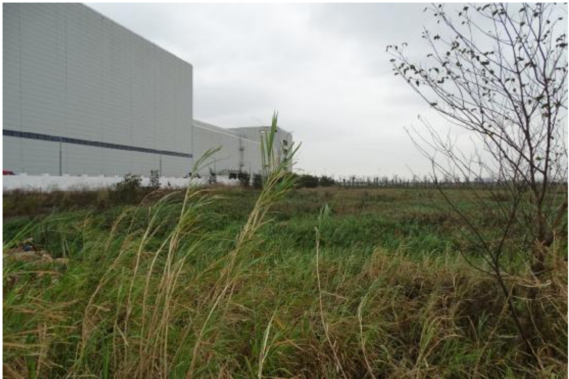
图 14 工程用地地表现状（北-南）