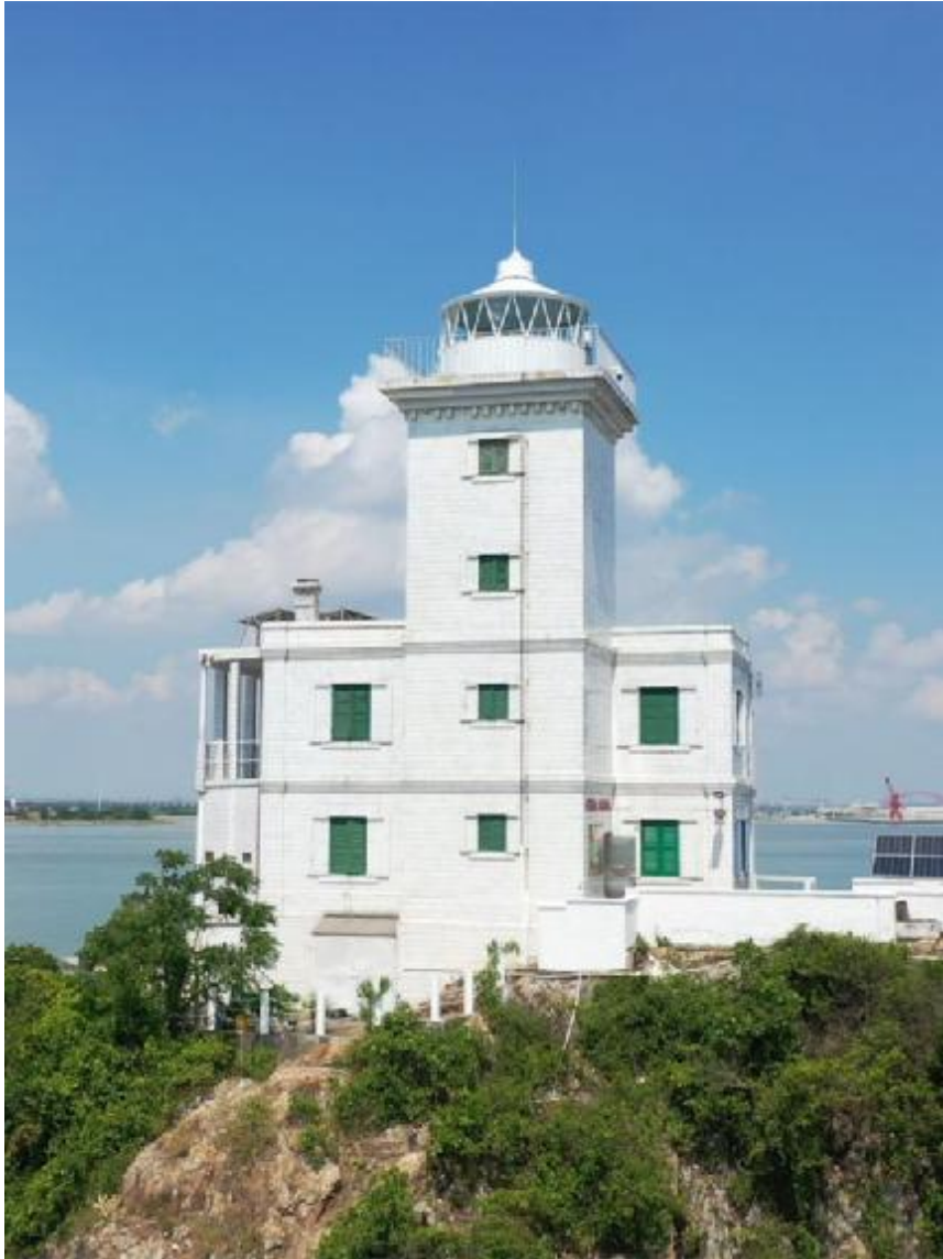
图 6 舢舨洲灯塔东面