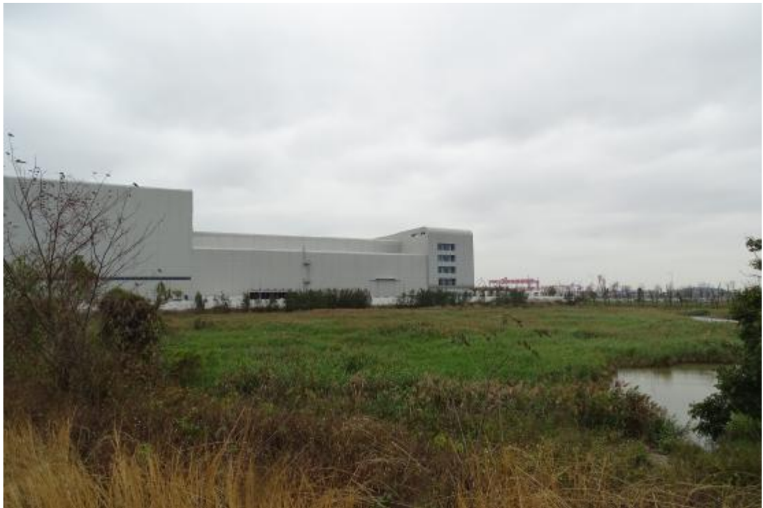
图 24 工程用地地表现状（北-南）