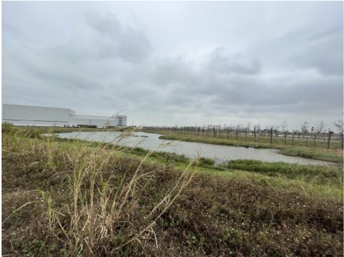
图 13 工程用地地表现状（西-东）