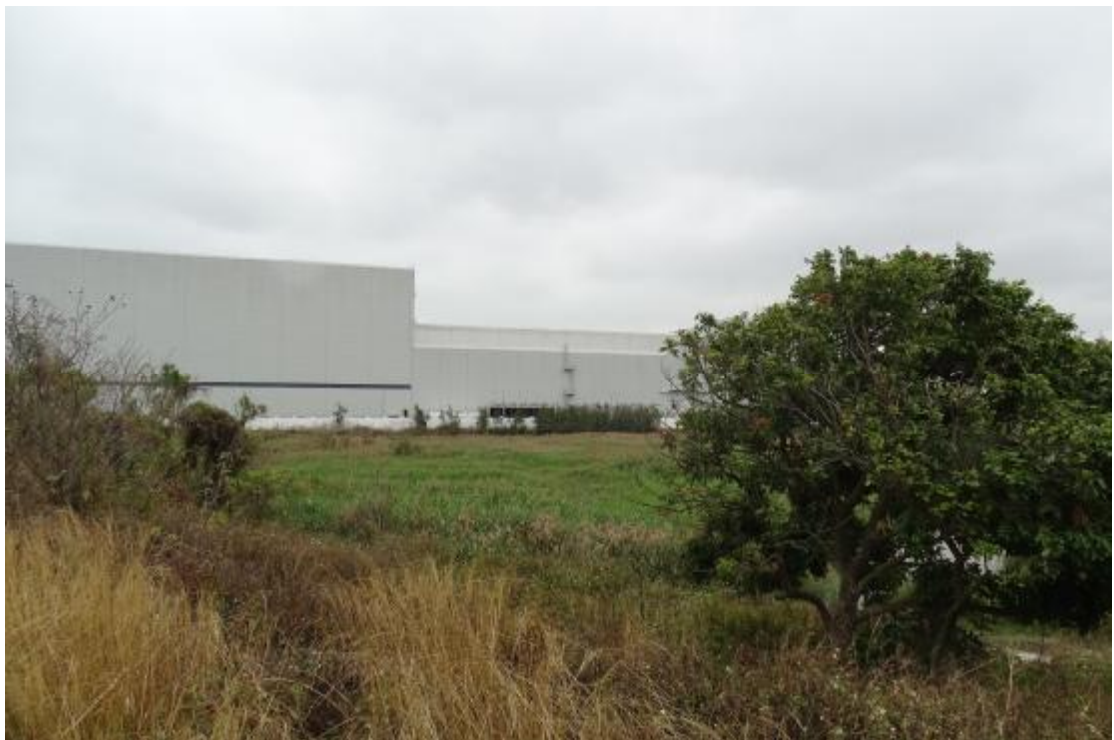
图 34 工程用地地表现状（西-东）