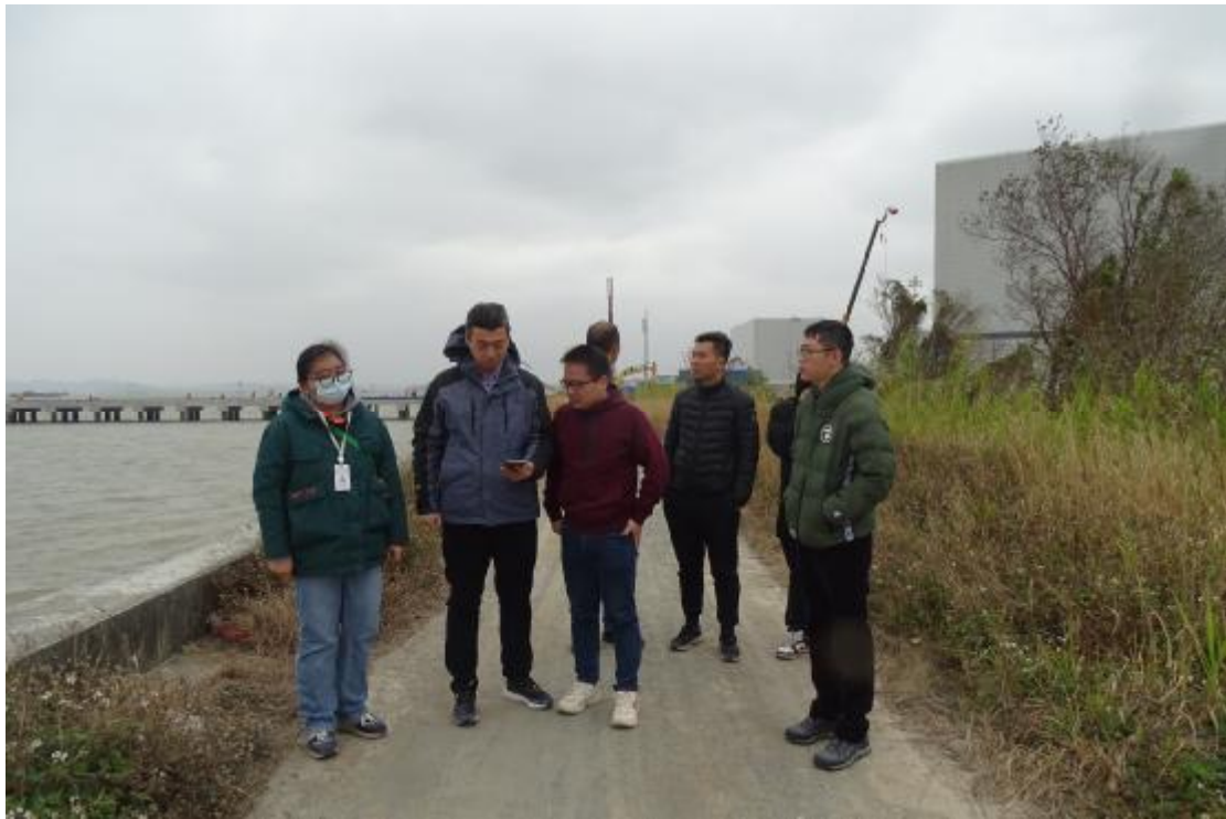
图 7 与现场工作人员确定工程用地范围（西-东）