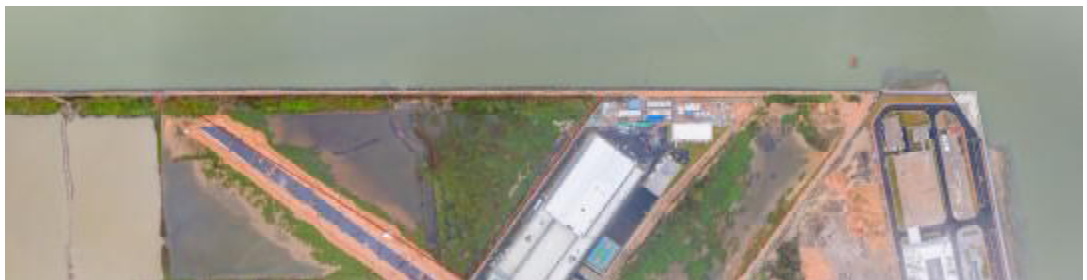
图 10 工程用地航拍示意图（上北下南）