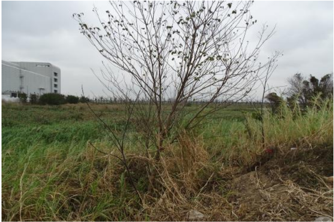
图 33 工程用地地表现状（北-南）