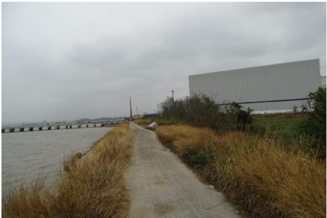
图 32 工程用地地表现状（西-东）