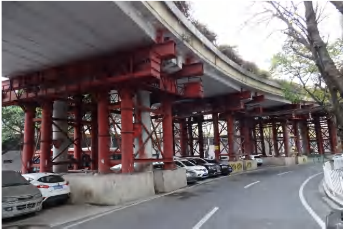
图 10 地块地表现状（南-北）