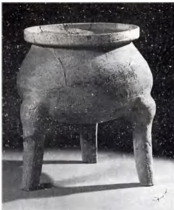
图 7 三元里梓园岗 1 号墓-“食官第一”陶鼎