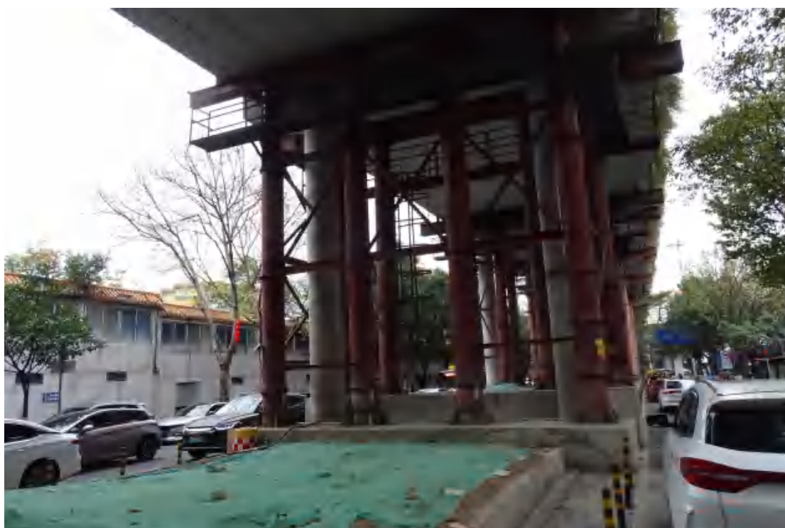
图 15 地块地表现状（西-东）