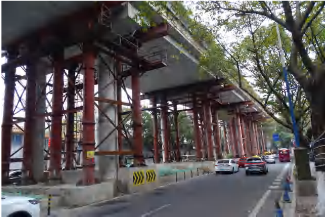
图 12 地块地表现状（西-东）