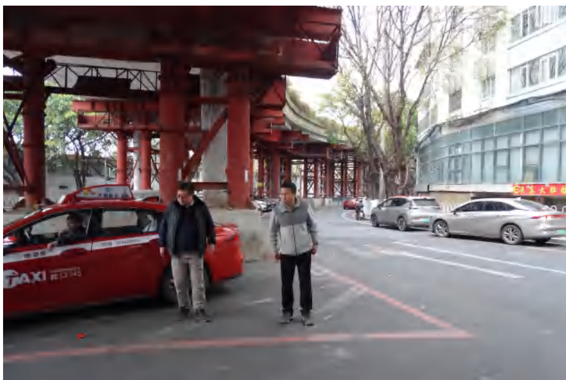
图 9 对地块地表进行踏查（西-东）