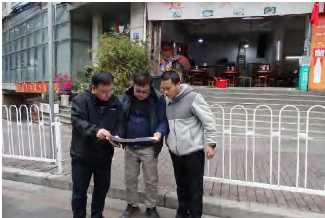
图 8 与现场工作人员确认地块范围（西-东）