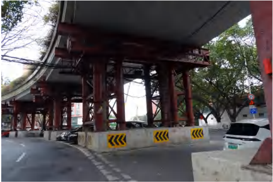
图 16 地块地表现状（东-西）