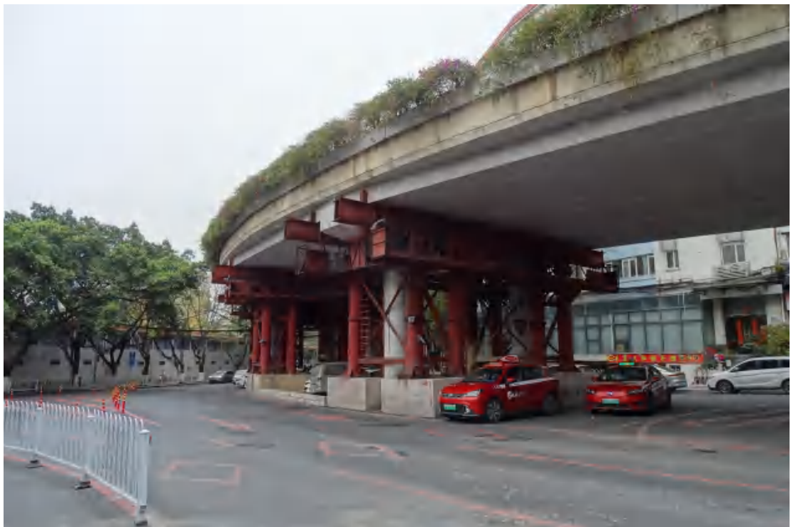
图 19 地块地表现状（南-北）