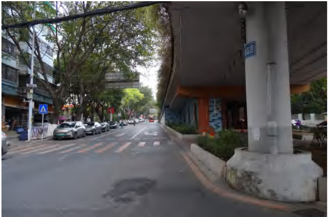
图 23 地块地表现状（西-东）