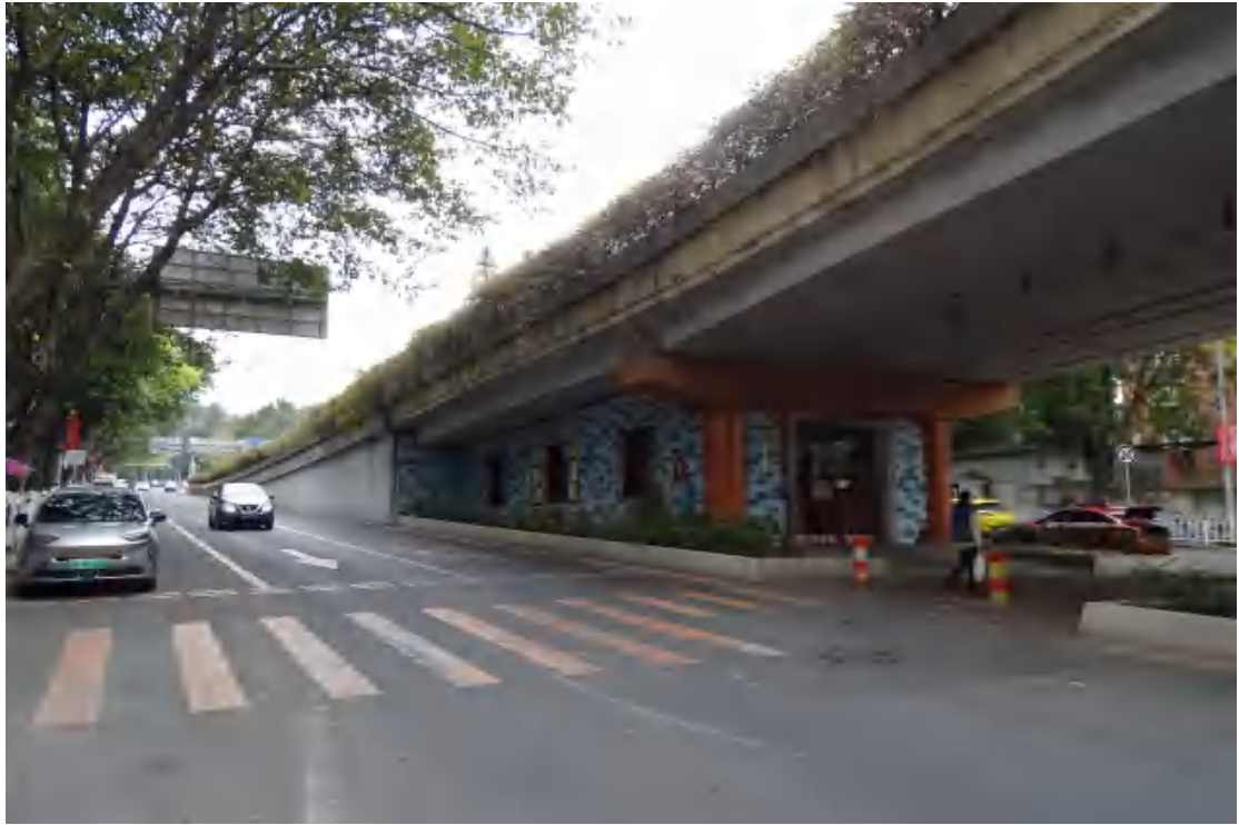
图 18 地块地表现状（北-南）