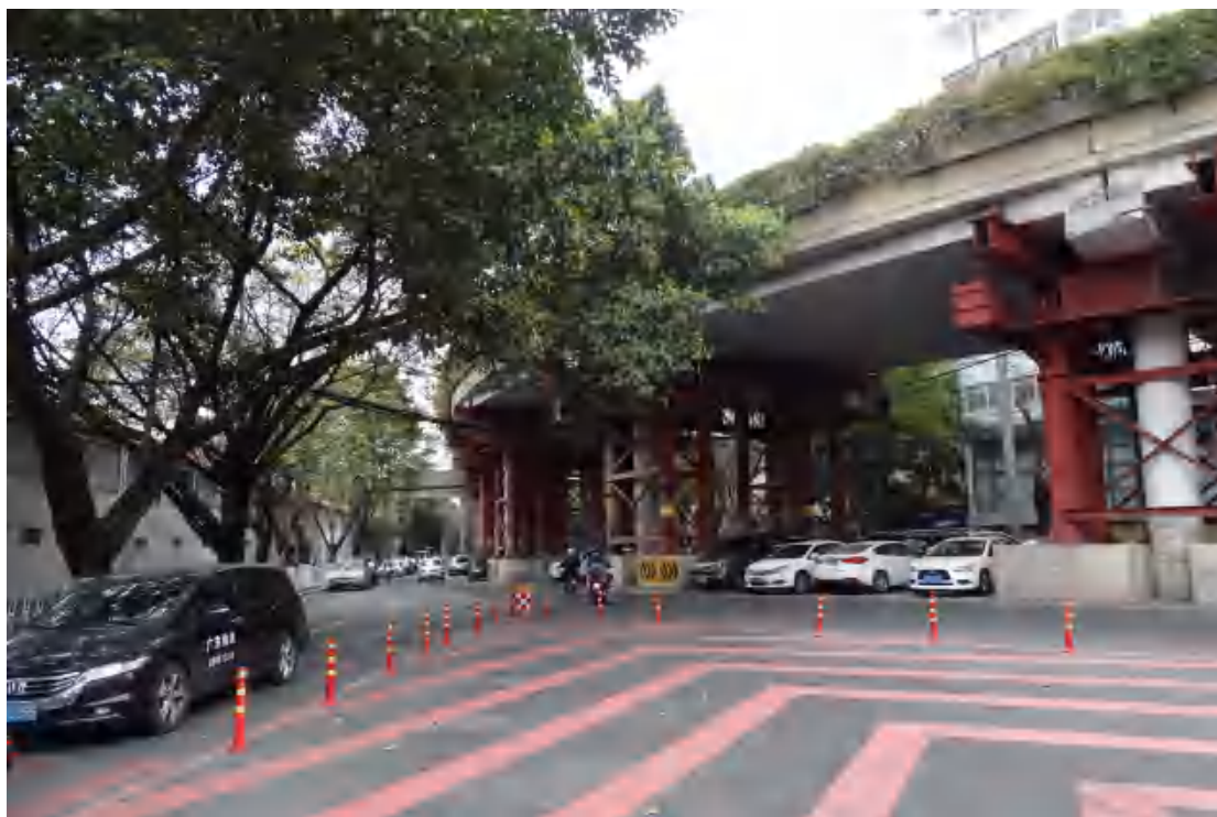
图 20 地块地表现状（西-东）