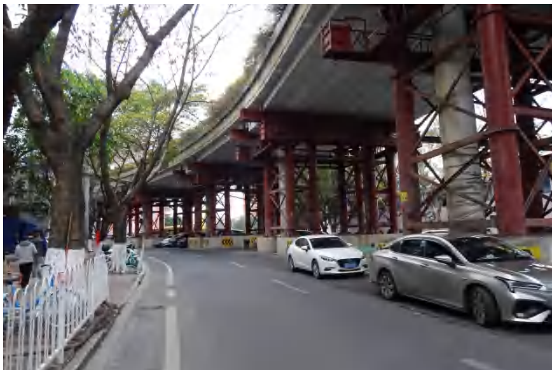
图 14 地块地表现状（东-西）