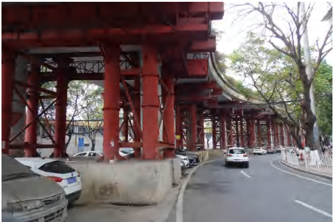
图 17 地块地表现状（西-东）