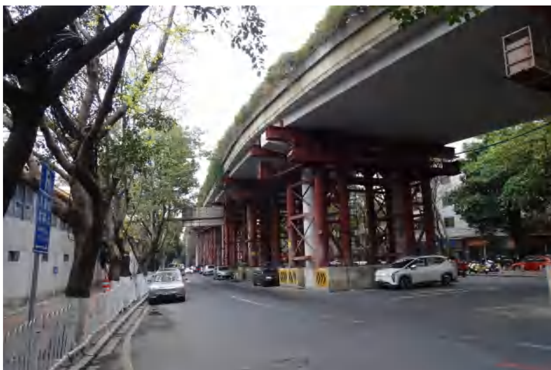
图 21 地块地表现状（西-东）