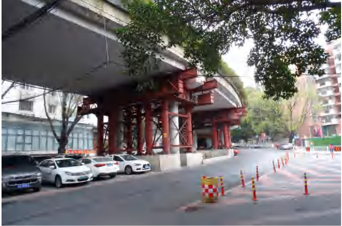
图 22 地块地表现状（东-西）