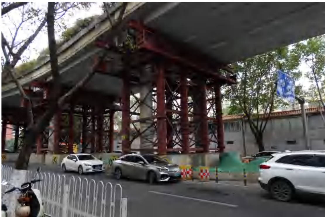
图 13 地块地表现状（东-西）