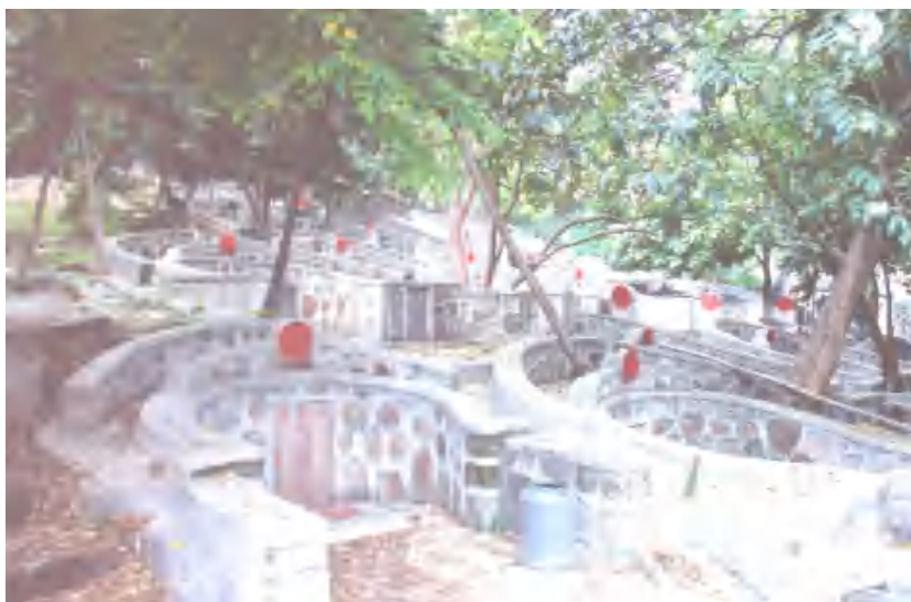
图 6 飞鹅岭李氏家族墓群侧面图

1953 年底发掘。墓地一带早已垦辟为菜地。墓坑深 1.2 米、长 3.55 米、宽 1.48 米，葬具与骸骨俱朽，已不见痕迹。陪葬器物 20 多件。有鼎、盒、壶等 1 套陶制礼器，瓮罐、三足罐、联罐、铜甑等陶制用品，还有铜熏炉、蟠螭纹铜镜和玉印（无文字）各 1 件。从遗物来看，墓的年代为西汉初期。出土的 1 件越式陶鼎，腹径 19.6 厘米，夹砂胎。形作盘口、深腹、蹄足，肩腹处刻“食官第一”4 字篆文。食官为秦汉时期掌管宫中膳食的官。墓主人当是汉初赵氏南越国宫中的小官吏。