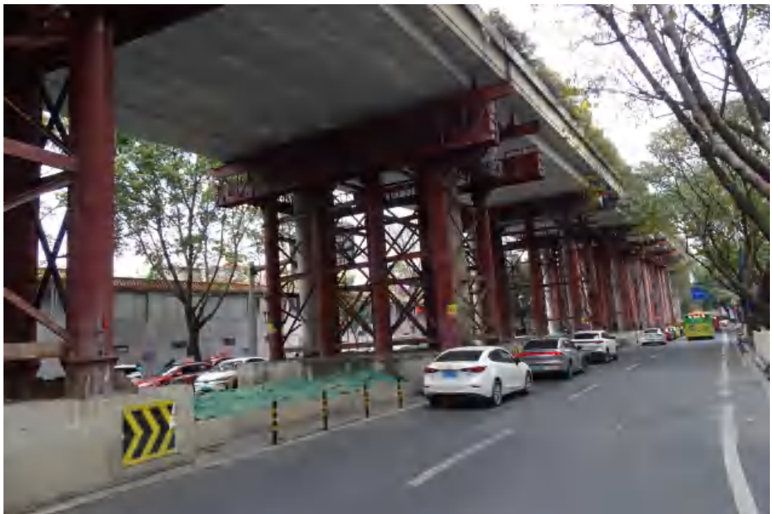
图 11 地块地表现状（西-东）