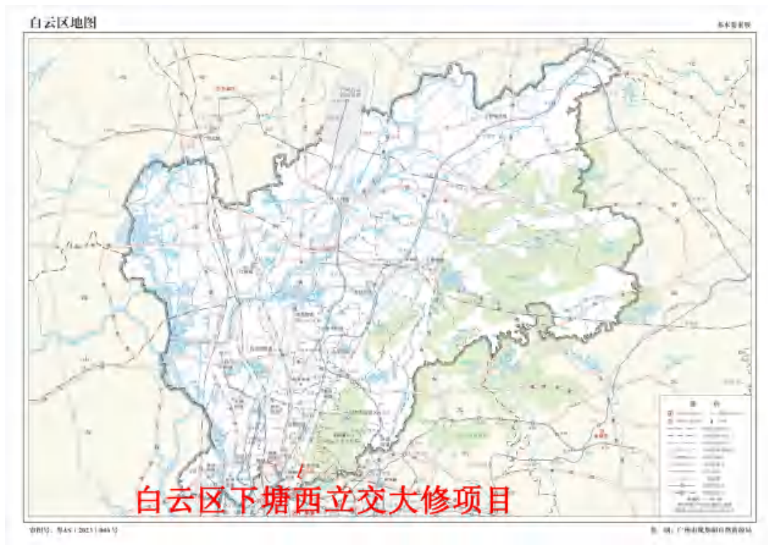
图 2 项目地块在白云区的位置示意图（广东省规划和自然资源局）