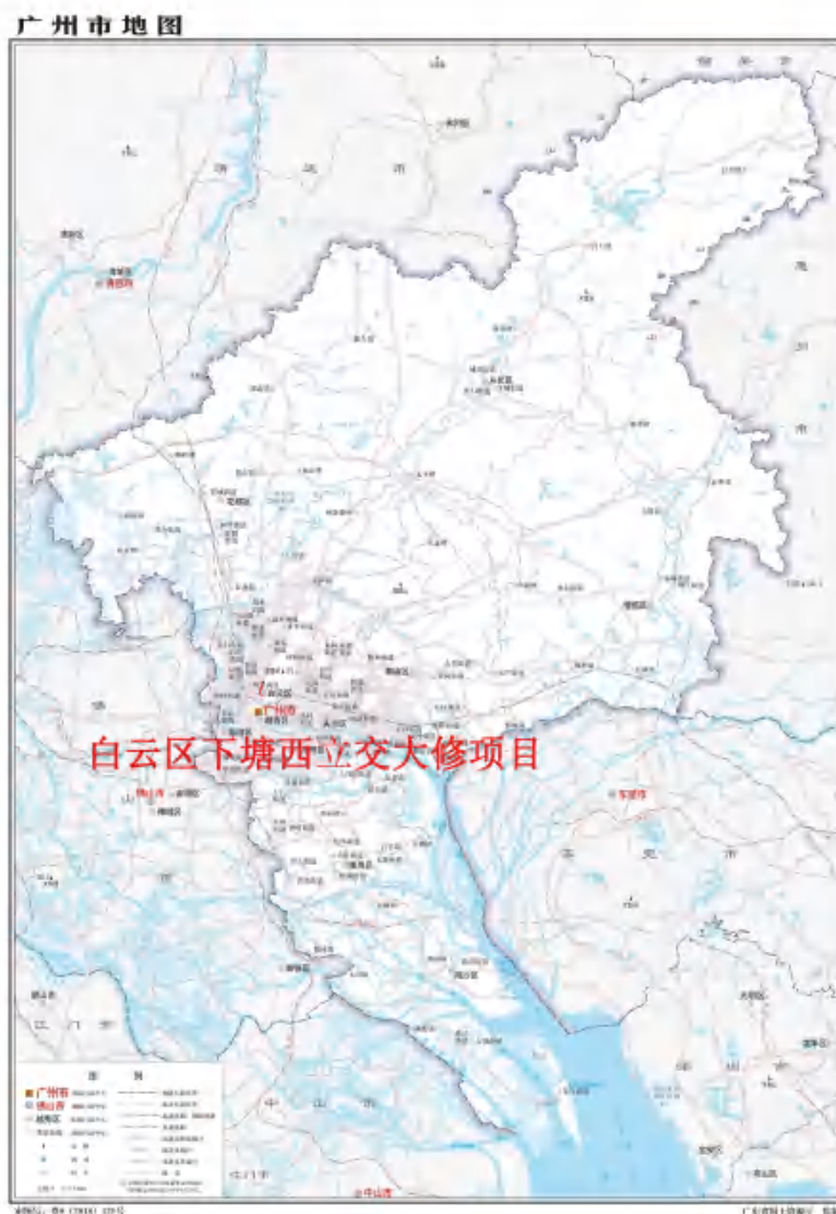
图 1 项目地块在广州市的位置示意图(广东省国土资源厅)

根据《中华人民共和国文物保护法》《广州市文物保护规定》，按照《广州市文物局关于广园路下塘西路立交大修工程考古调查勘探工作的复函》（文物 2023443 号）的指导意见，受广州中心区交通项目管理中心委托，由我院配合该项目地块建设，对该地块进行考古调查工作。