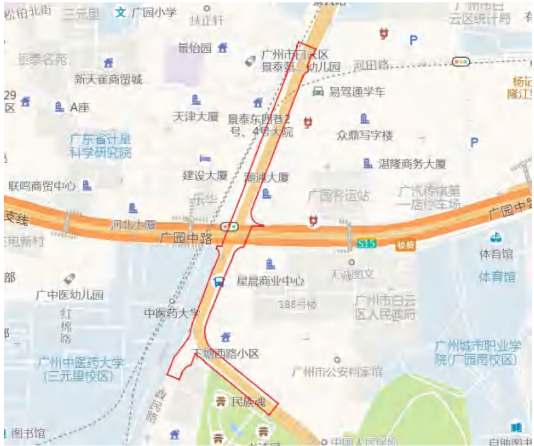
图 4 项目地块周边环境示意图（高德地图）