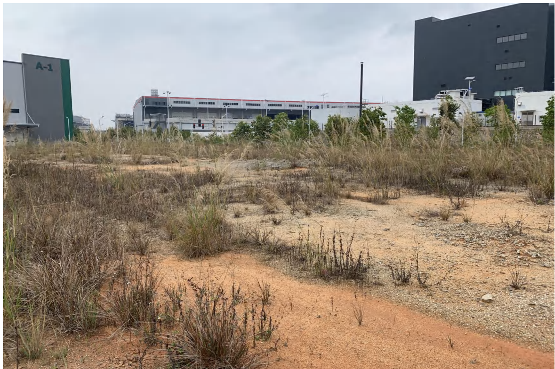
图 12 地块内现状（东-西）