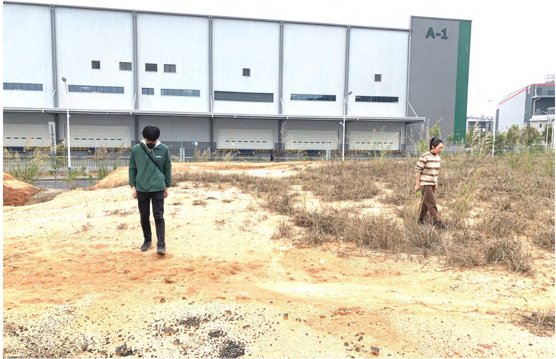
图 7 现场踏查（东北-西南）