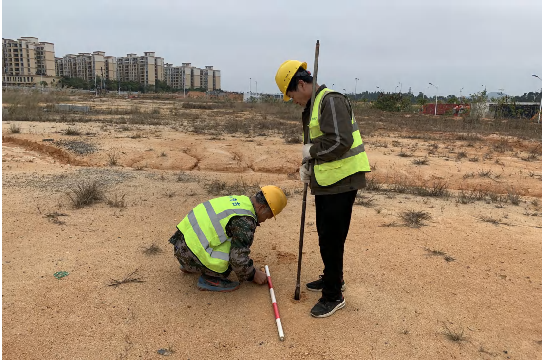
图 21 土样提取（西北-东南）