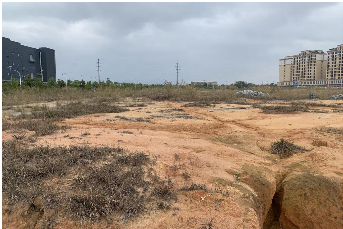
图 16 地块内现状（西-东）