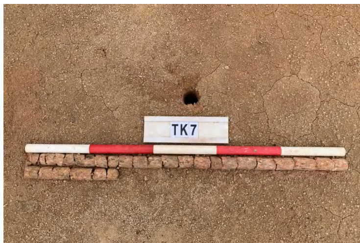
图 29 TK7 土样（一米标杆，土样由左上往右下）

①层：垫土层，距地表深 0-1.3 米，厚 1.3 米，为灰红色黏土，土质较疏松，含石子、砂砾。以下有大石块，无法提取土样。