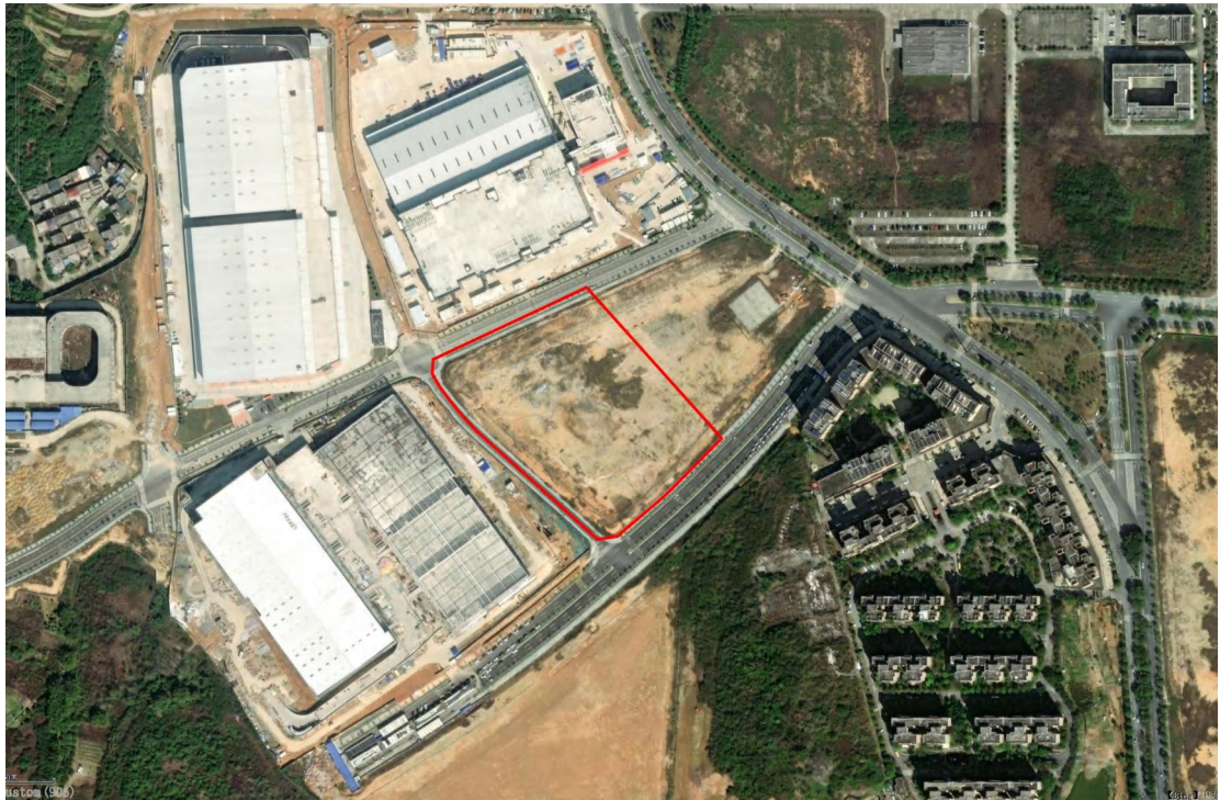
图 5 项目地块卫星红线图（奥维地图）