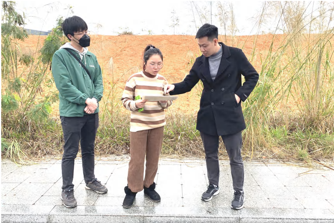
图6 工作人员确认地块范围（东北-西南）