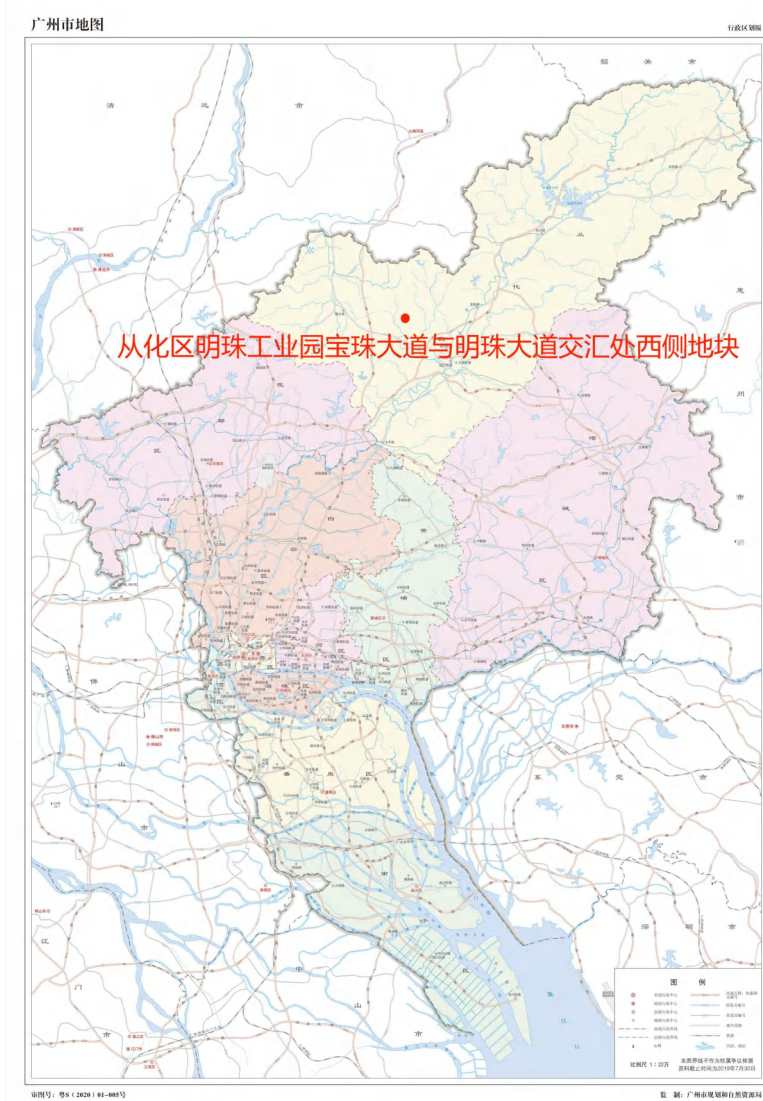
图 1 项目地块在广州市位置示意图（广州市规划和自然资源局）

根据《中华人民共和国文物保护法》《广州市文物保护规定》，按照《广州市文物局关于从化区明珠工业园宝珠大道与明珠大道交汇处西侧地块考古调查勘探工作的复函》（文物 20240173 号）指导意见，受广州市鳌头镇横坑村民居委会委托，由我院负责该项目的考古调查工作。