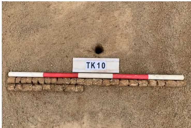
图 32 TK10 土样（一米标杆，土样由左上往右下）

①层：垫土层，距地表深 0-1.42 米，厚 1.42 米，为灰红色黏土，土质较疏松，含石子、砂砾。以下有大石块，无法提取土样。