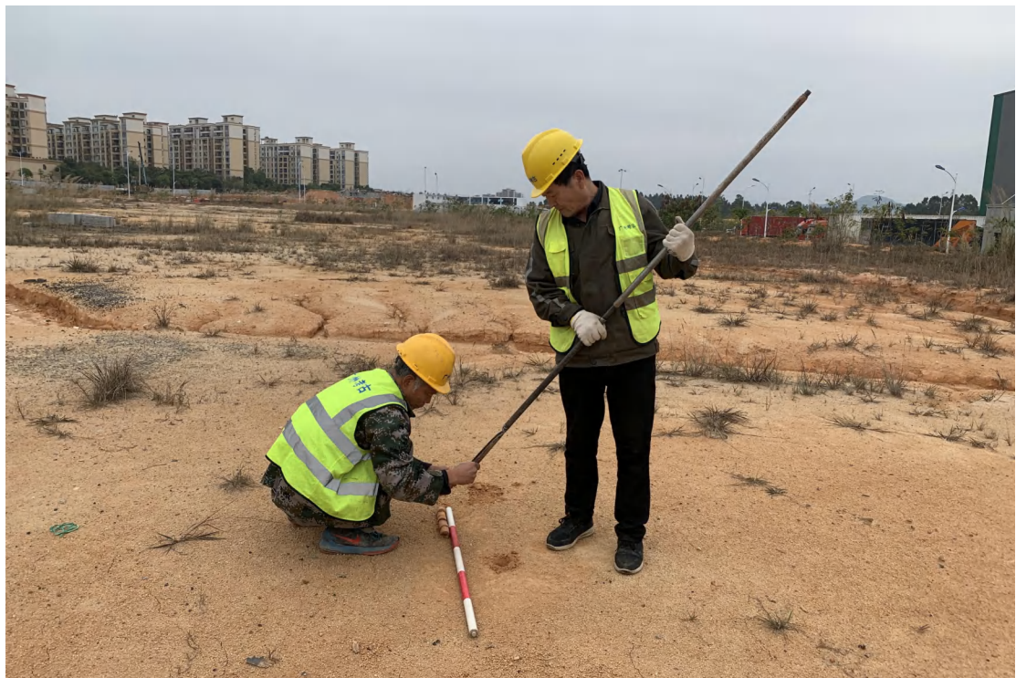
图 22 土样分析（西北-东南）