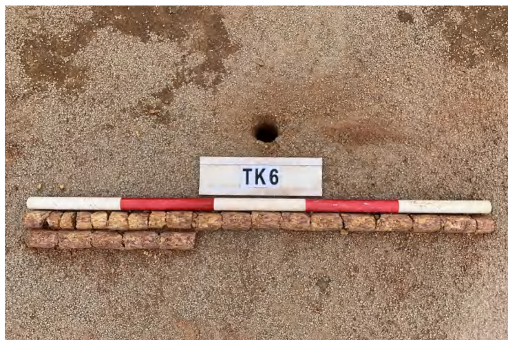
图 28 TK6 土样（一米标杆，土样由左上往右下）

①层：垫土层，距地表深 0-1.35 米，厚 1.35 米，为灰红色黏土，土质较疏松，含石子、砂砾。以下有大石块，无法提取土样。