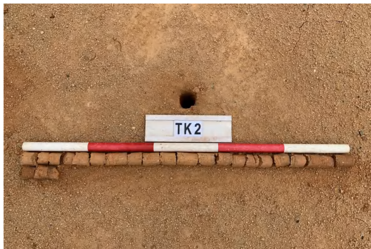
图 24 TK2 土样（一米标杆，土样由左上往右下）

①层：垫土层，距地表深 0-1.1 米，厚 1.1 米，为灰红色黏土，土质较疏松，含石子、砂砾。以下有大石块，无法提取土样。