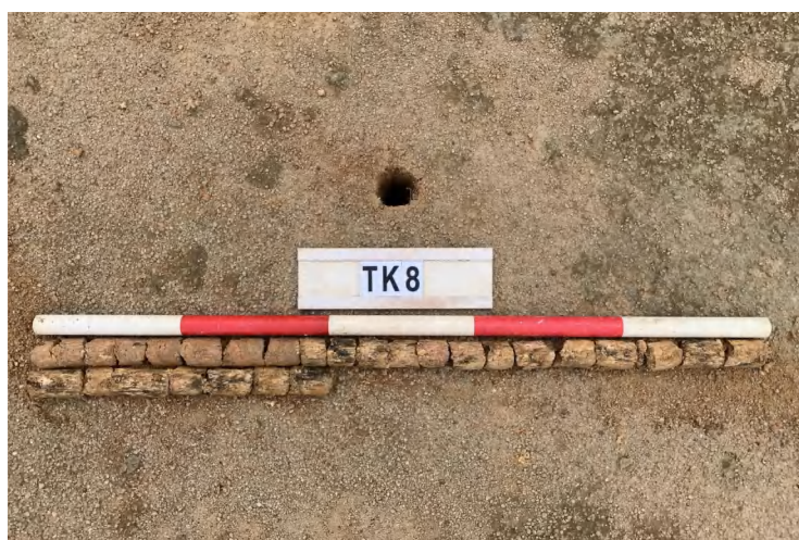
图 30 TK8 土样（一米标杆，土样由左上往右下）

①层：垫土层，距地表深 0-1.4 米，厚 1.4 米，为灰红色黏土，土质较疏松，含石子、砂砾。以下有大石块，无法提取土样。