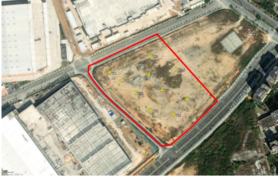
图 19 试探探孔位置分布图（黄色标记点）

为进一步了解并掌握该地块内地层堆积情况，我们在地块范围内进行了试探。选取 10 个标准型探孔，编号为 TK1-TK10，具体情况如下：