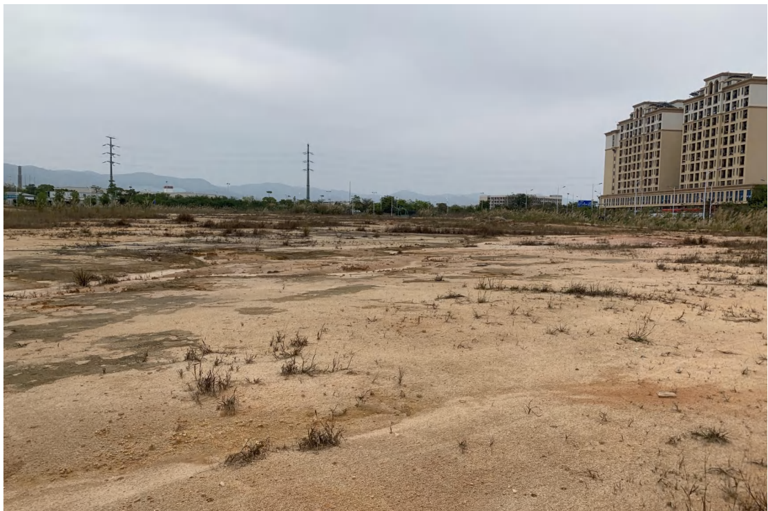
图 18 地块内现状（西南-东北）