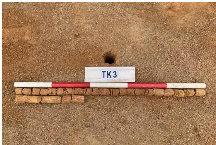
图 25 TK3 土样（一米标杆，土样由左上往右下）

①层：垫土层，距地表深 0-1.38 米，厚 1.38 米，为灰黄色黏土，土质较疏松，含石子、砂砾。以下有大石块，无法提取土样。