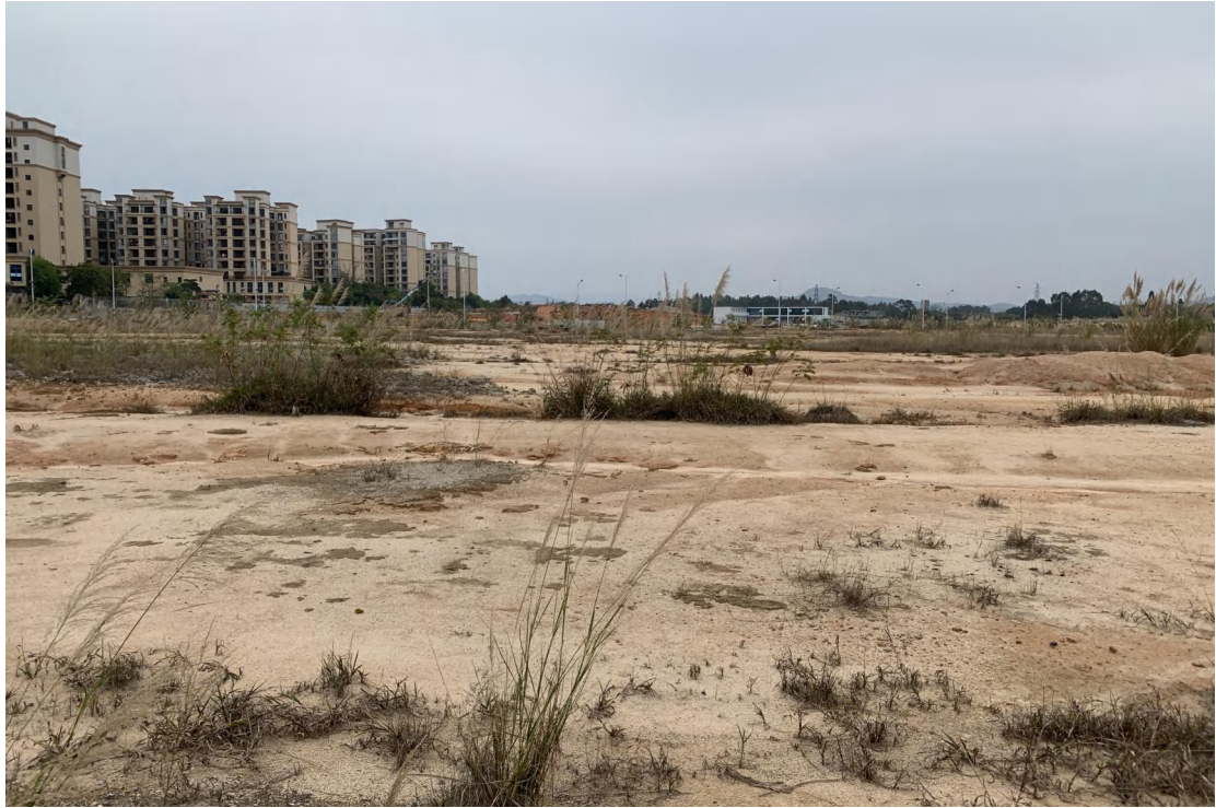
图 9 地块内现状（北-南）