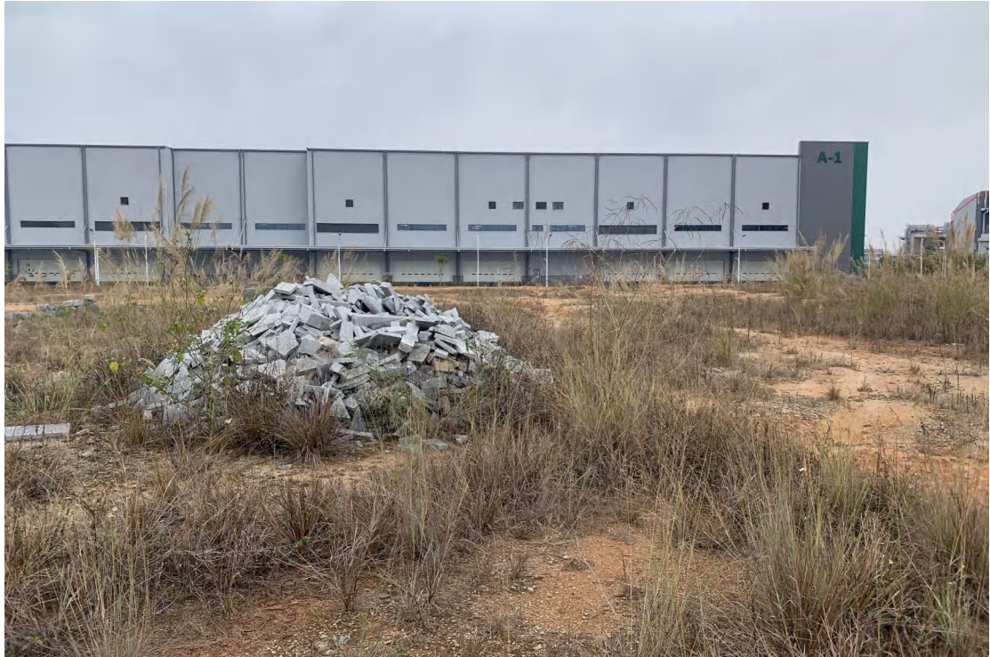
图 11 地块内现状（东北-西南）