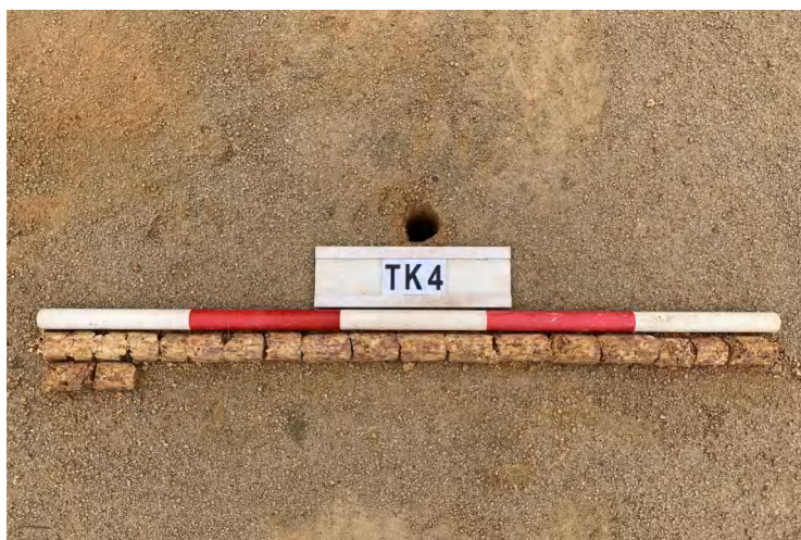
图 26 TK4 土样（一米标杆，土样由左上往右下）

①层：垫土层，距地表深 0-1.12 米，厚 1.12 米，为灰黄色黏土，土质较疏松，含石子、砂砾。以下有大石块，无法提取土样。