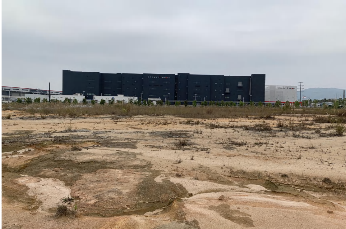
图 13 地块内现状（南-北）