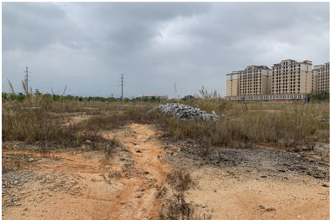
图 14 地块内现状（西北-东南）