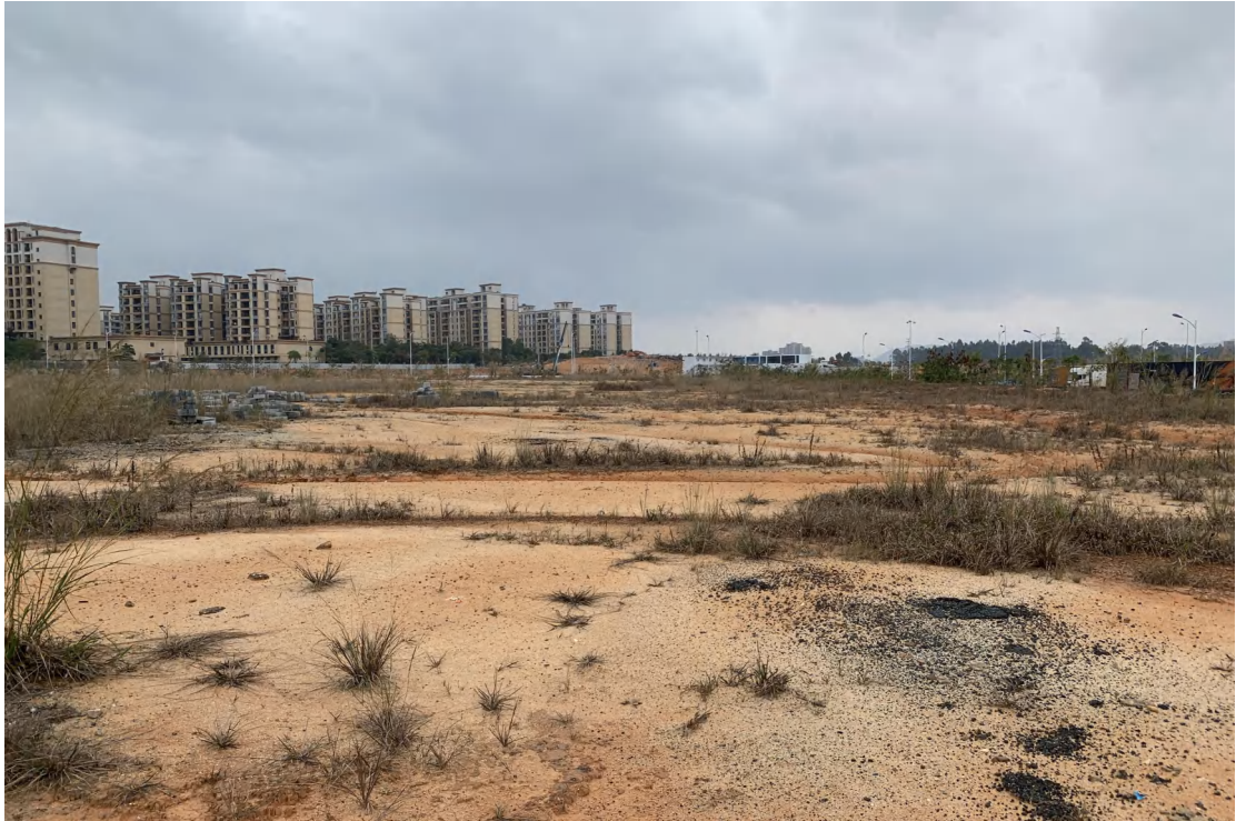
图 17 地块内现状（西-东）