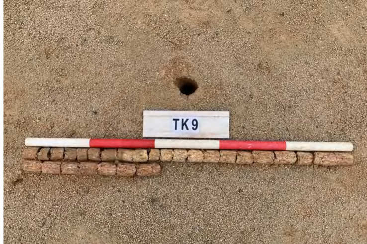
图 31 TK9 土样（一米标杆，土样由左上往右下）

①层：垫土层，距地表深 0-1.4 米，厚 1.4 米，为灰红色黏土，土质较疏松，含石子、砂砾。以下有大石块，无法提取土样。