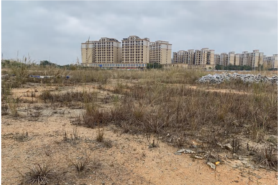
图 15 地块内现状（西北-东南）