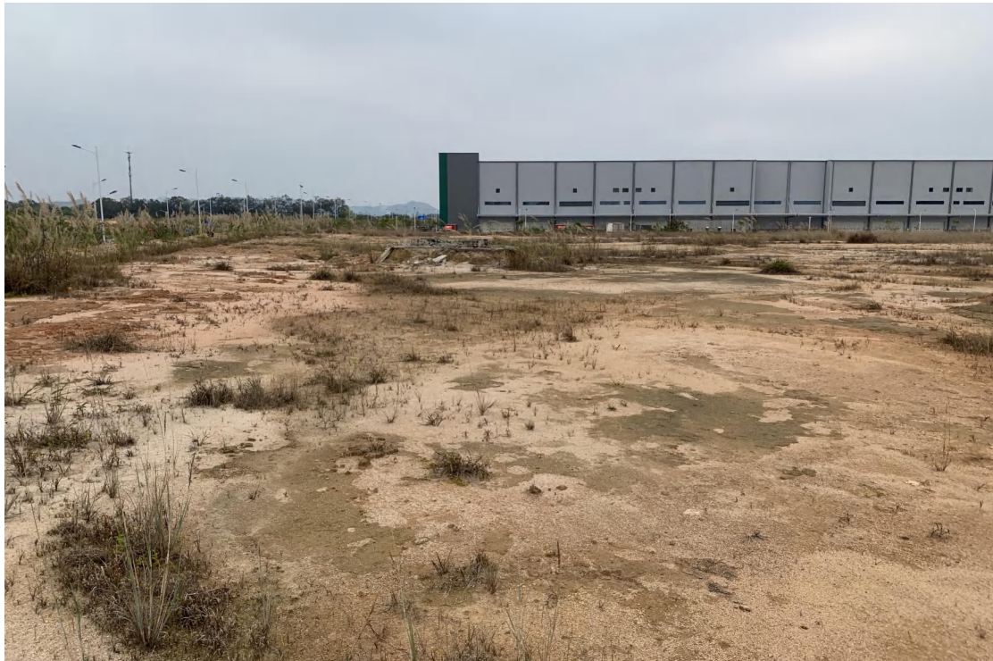
图 10 地块内现状（东北-西南）