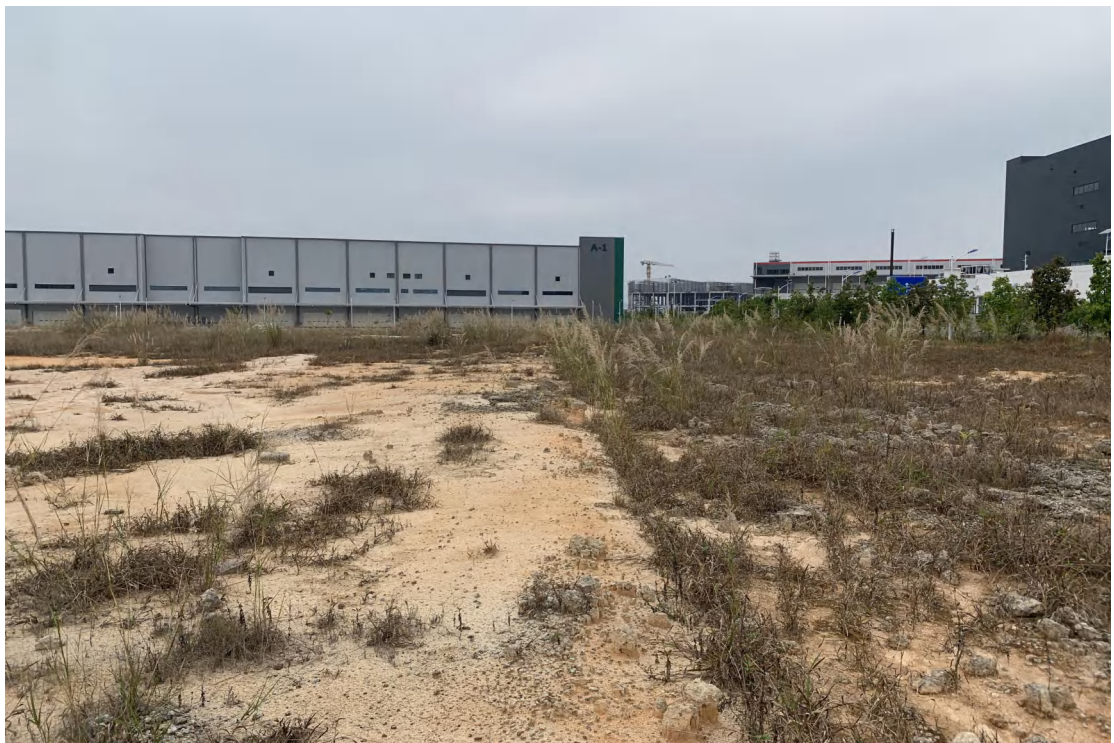
图 8 地块内现状（东-西）