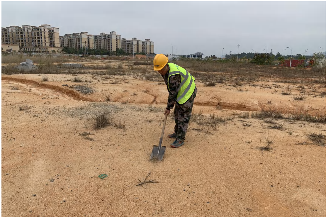
图 20 地表清理（西北-东南）