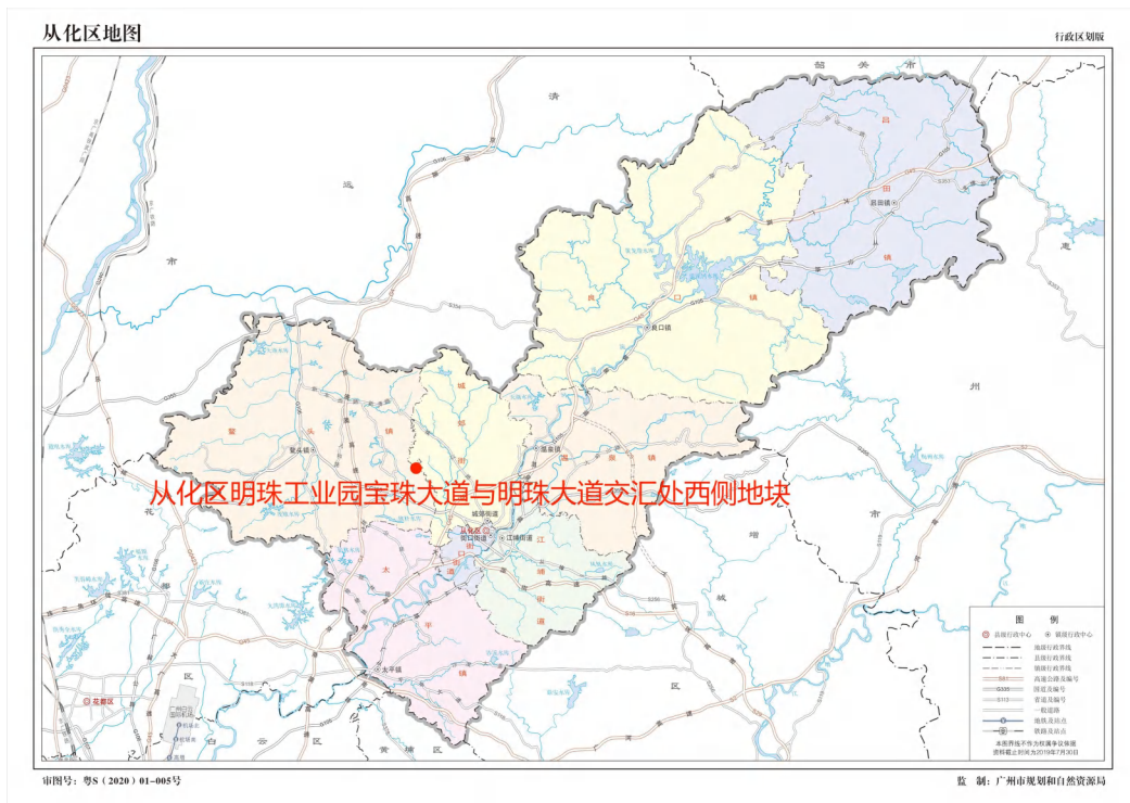
图 2 项目地块在从化区位置示意图（广州市规划和自然资源局）