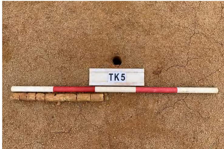
图 27 TK5 土样（一米标杆，土样由左往右）

①层：垫土层，距地表深 0-0.42 米，厚 0.42 米，为灰黄色黏土，土质较疏松，含石子、砂砾。以下有大石块，无法提取土样。