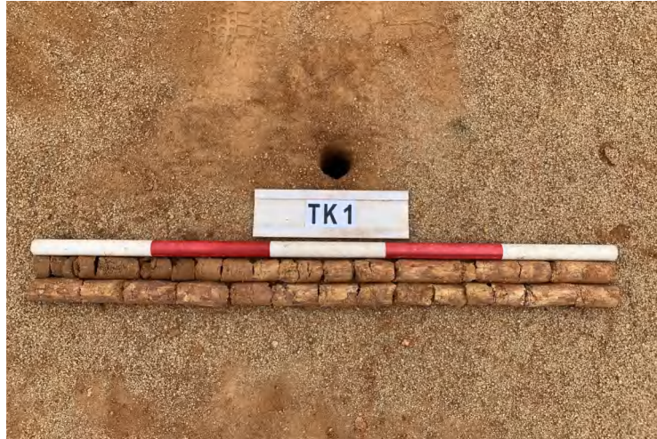
图 23 TK1 土样（一米标杆，土样由左上往右下）

①层：垫土层，距地表深 0-2.0 米，厚 2.0 米，为灰红色黏土，土质较疏松，含石子、砂砾。以下有大石块，无法提取土样。