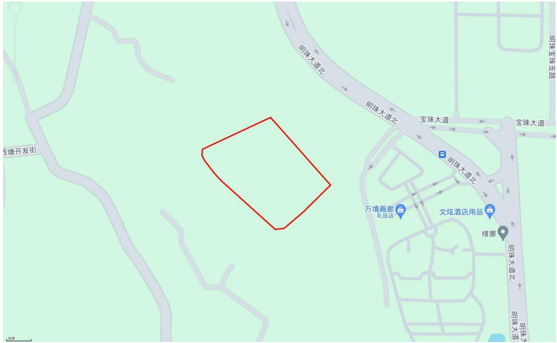
图 4 项目地块周边环境示意图（奥维地图）