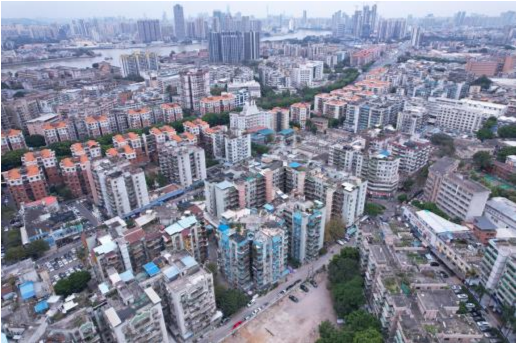
图 9 地块外东部地形地貌（西-东）