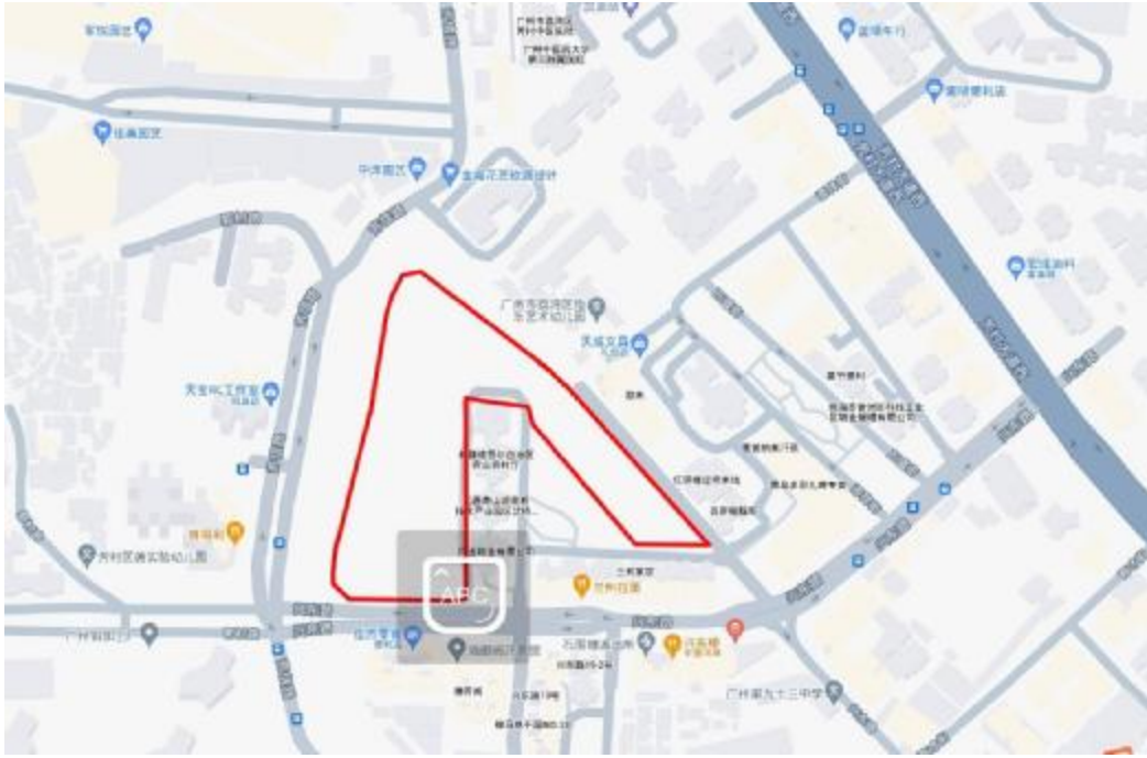
图 3 项目地块周边环境示意图（奥维地图）