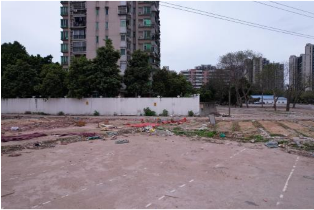
图 24 地块内南部现状（北-南）