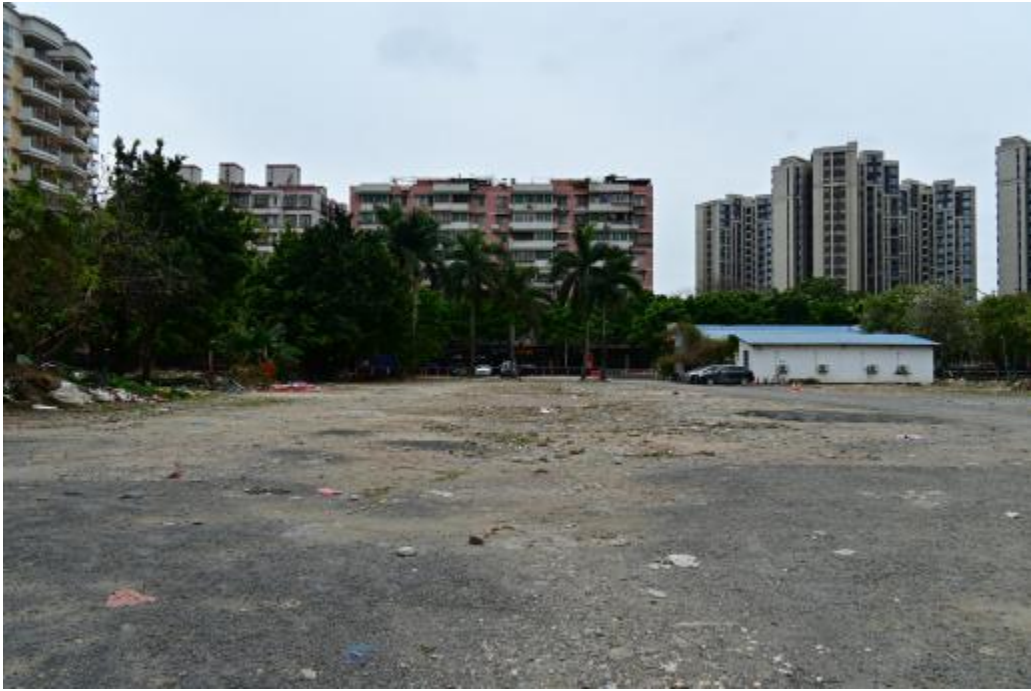
图 12 地块内南部现状（北-南）