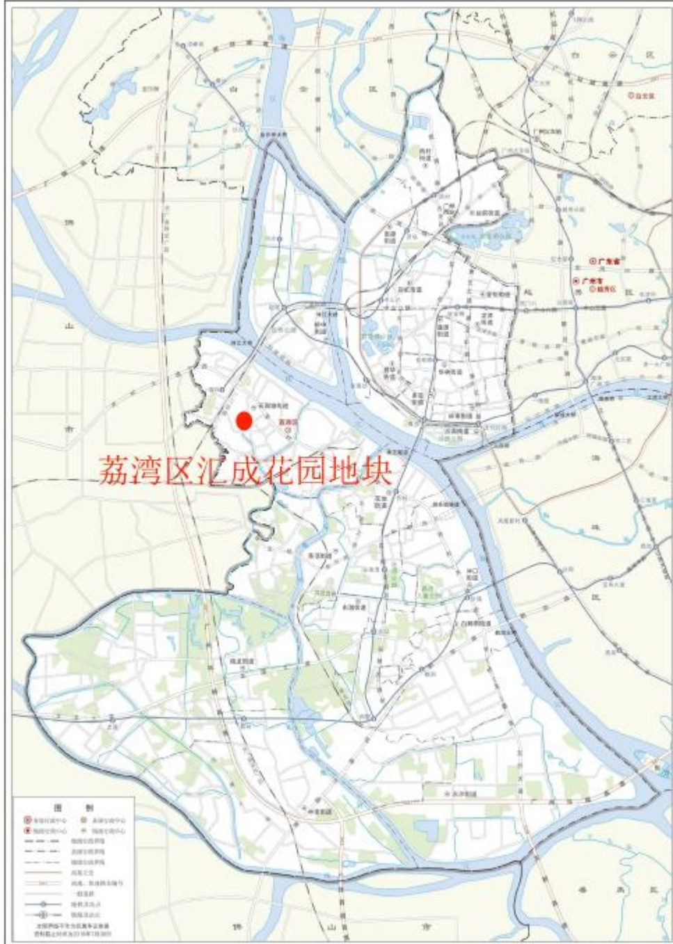
图 2 项目地块在荔湾区位置示意图（广州市规划和自然资源局）