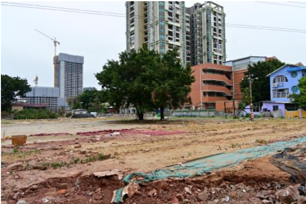
图 17 地块内西部现状（东南-西北）