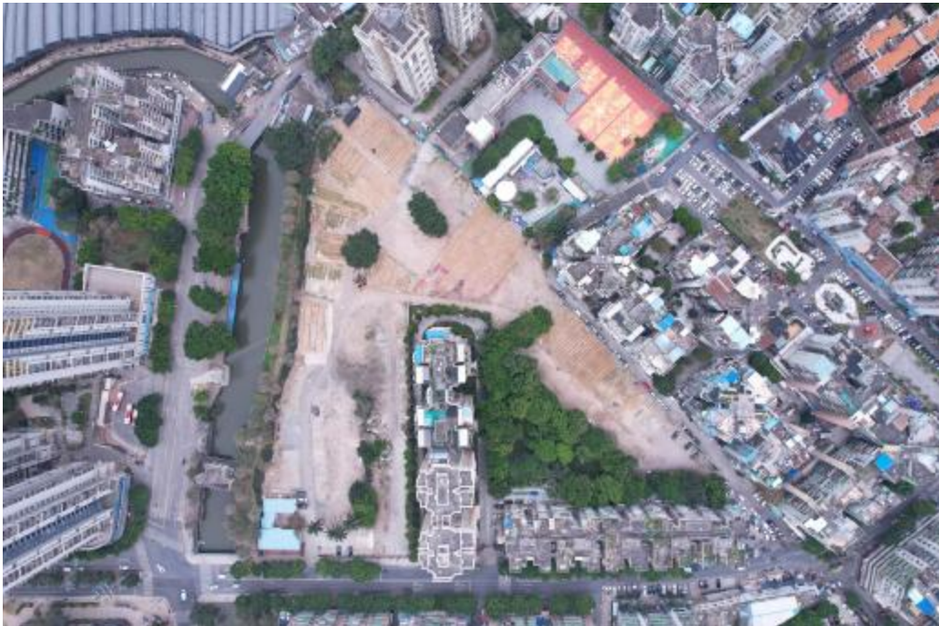
图 7 地块全景航拍（上北-下南）