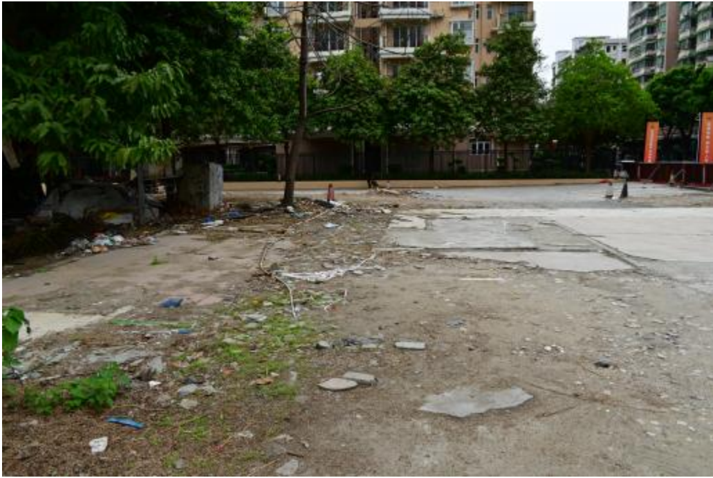
图 22 地块内东部现状（西-东）