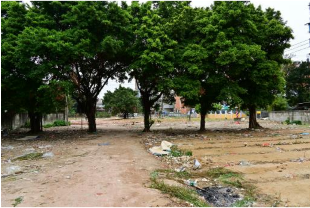
图 16 地块内东部现状（东南-西北）