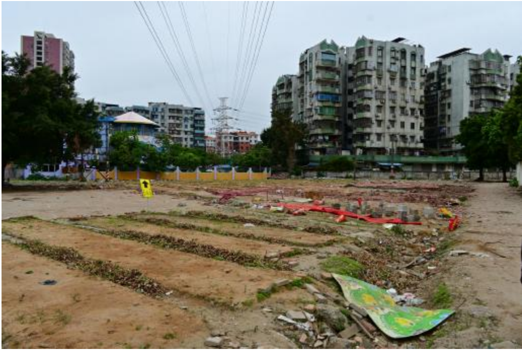
图 20 地块内东北部现状（南-北）