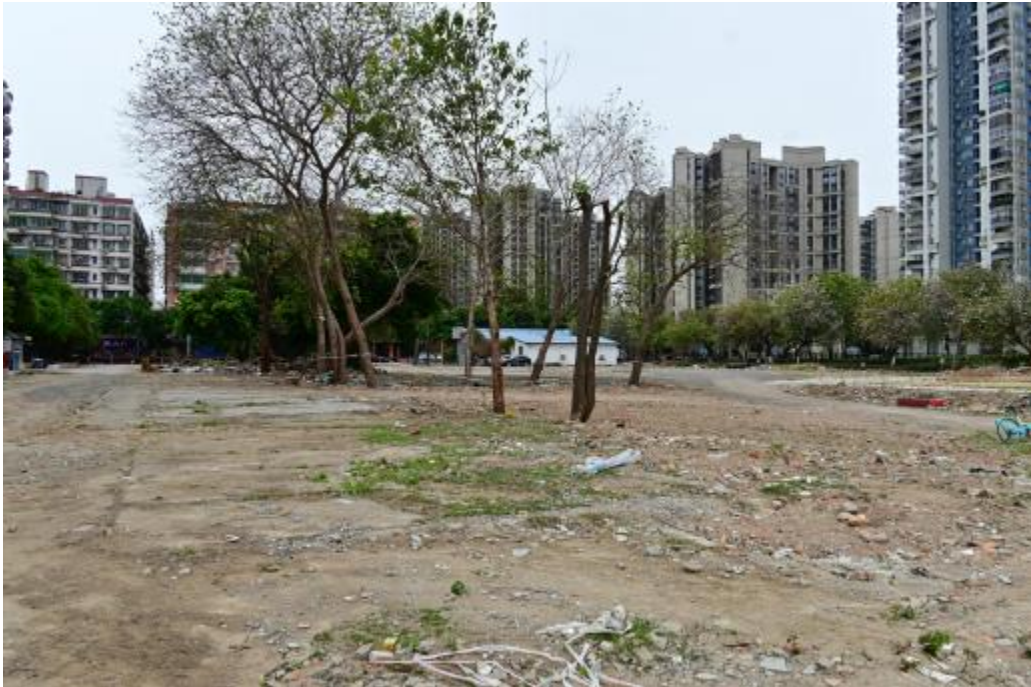
图 15 地块内南部现状（北-南）