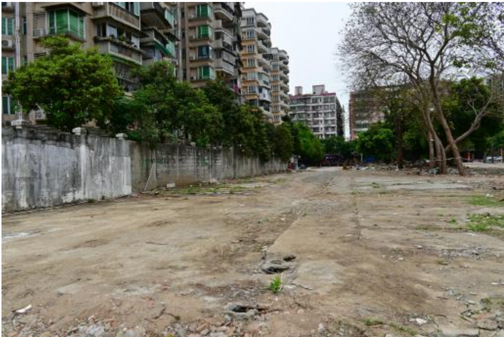
图 13 地块内北部现状（北-南）