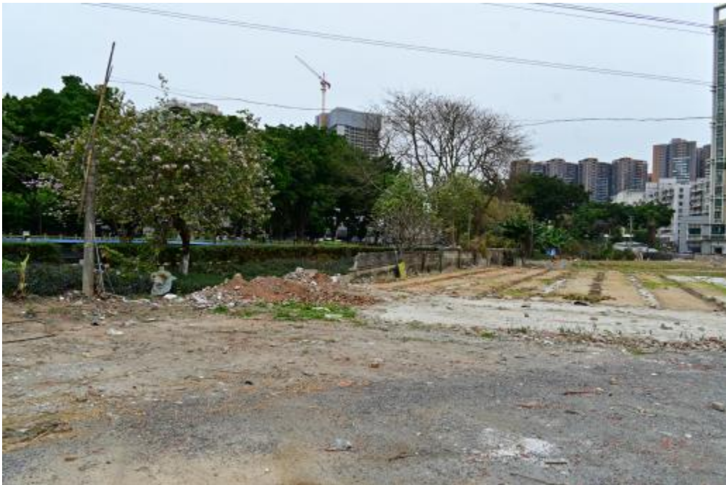
图 21 地块内西北部现状（南-北）