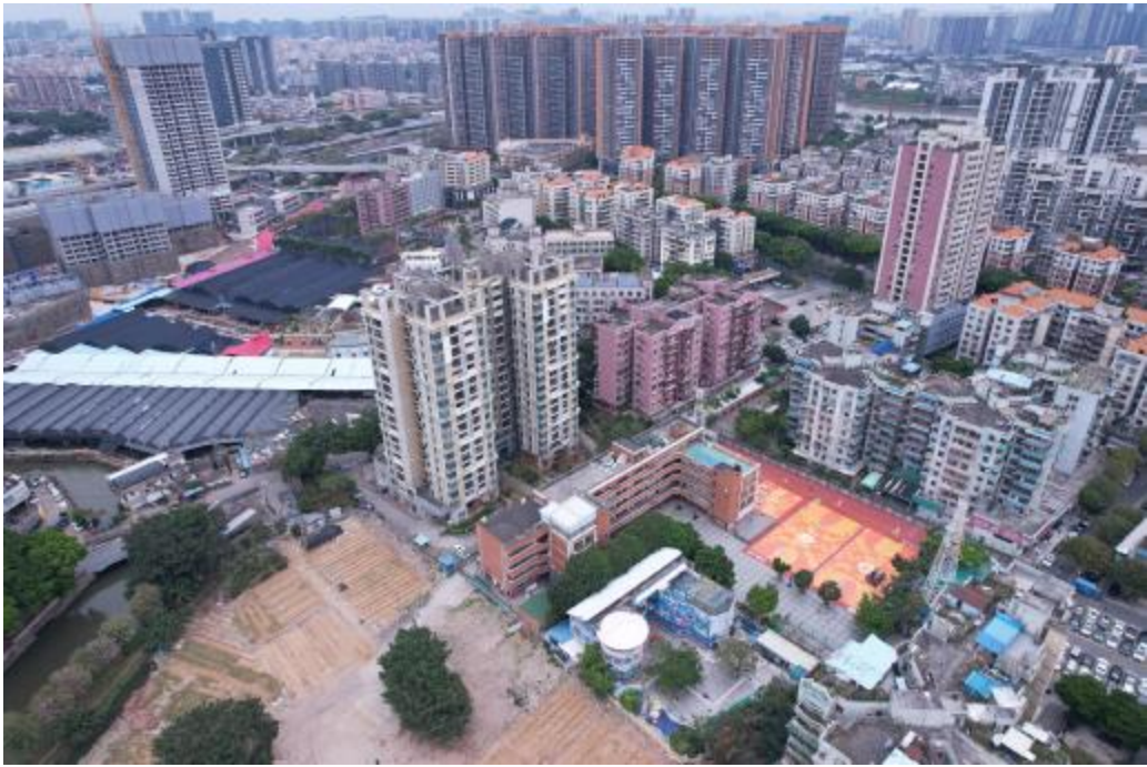
图 8 地块外北部地形地貌（南-北）