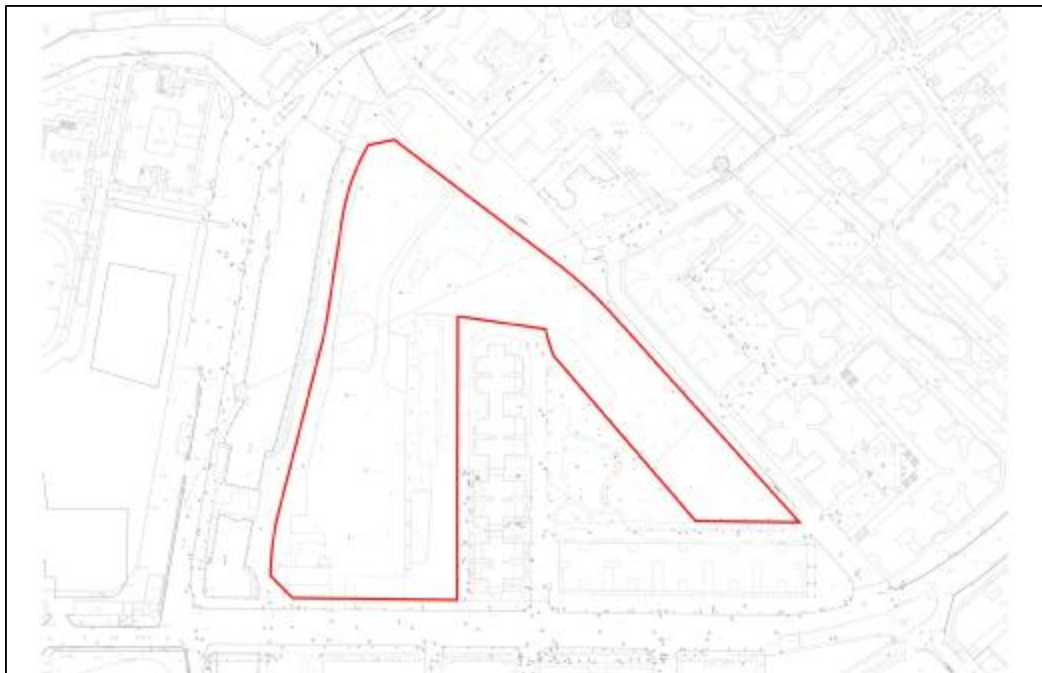
图 4 项目地块地形红线图