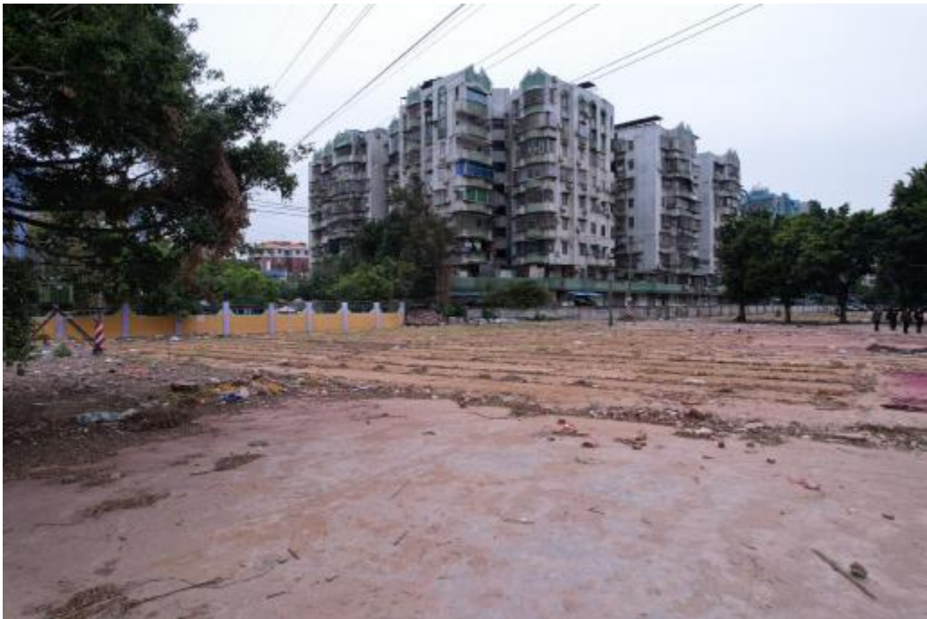
图 25 地块内北部现状（西-东）