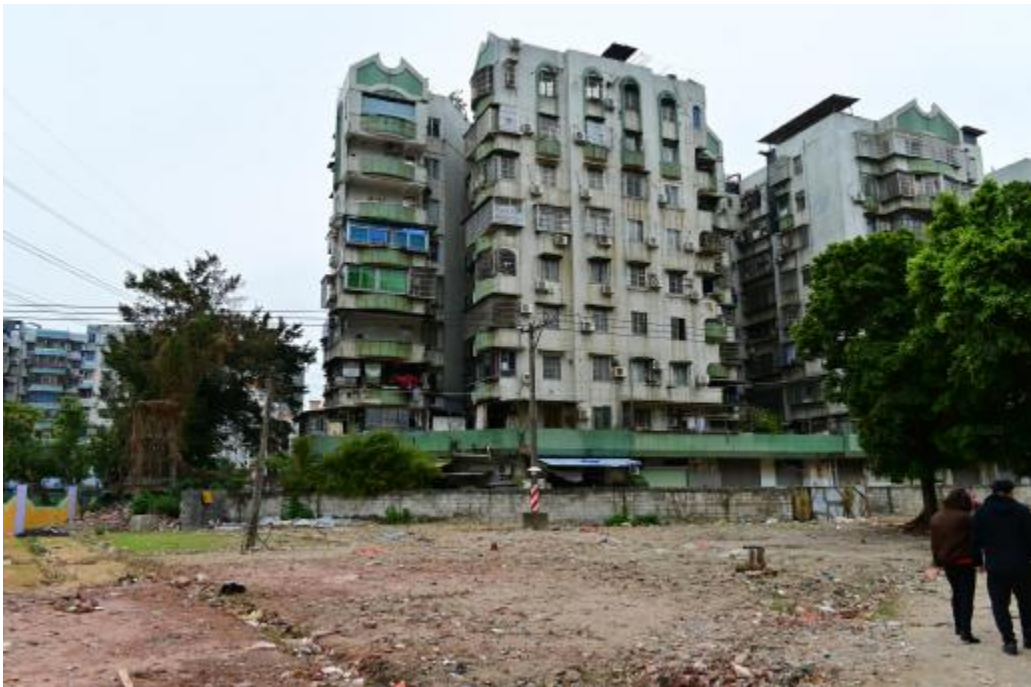
图 23 地块内南部现状（西南-东北）