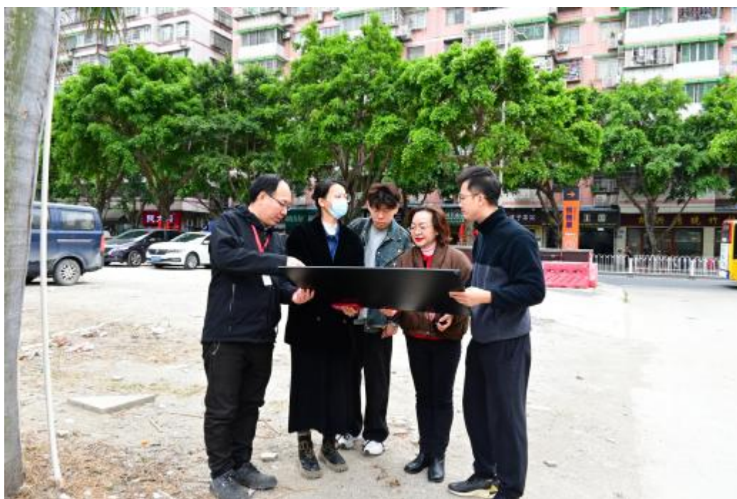
图 5 工作人员确定地块范围（北-南）