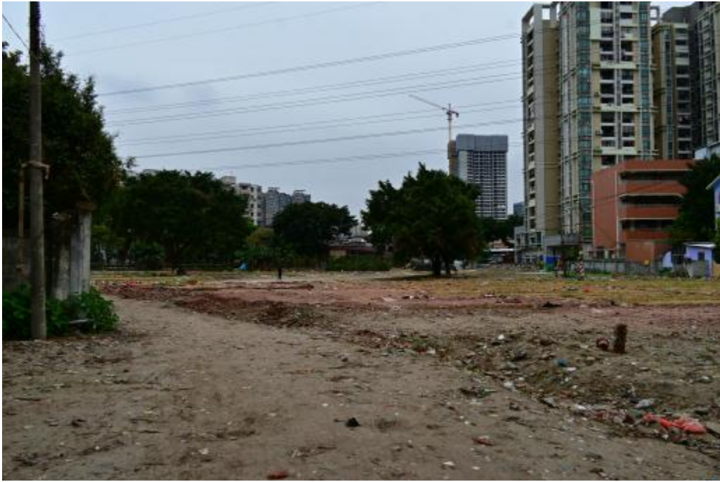
图 18 地块内西北部现状（东-西）