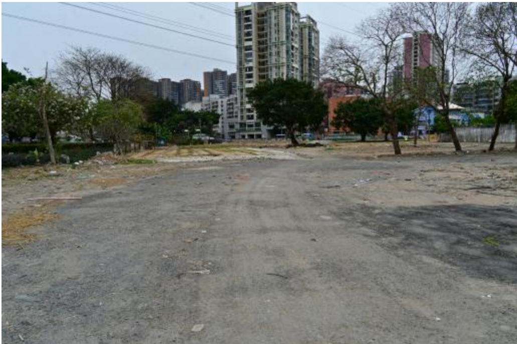
图 19 地块内北部现状（南-北）