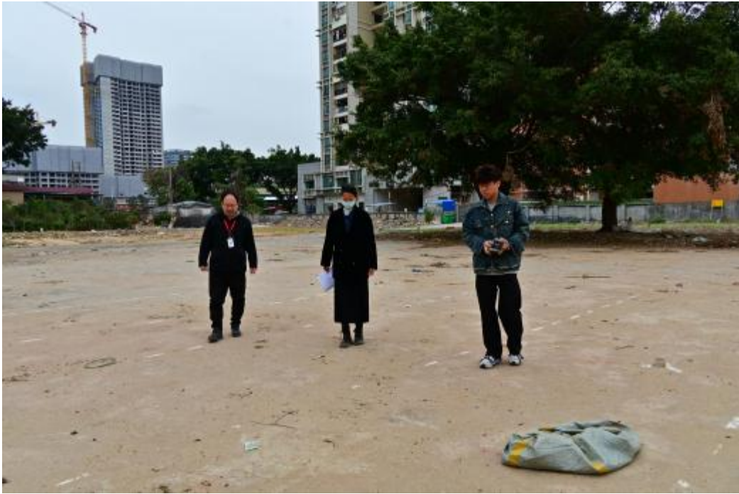
图 6 现场踏查（南-北）