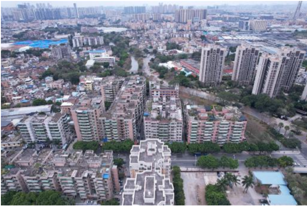
图 10 地块外南部地形地貌（北-南）