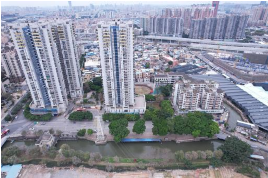
图 11 地块外西部地形地貌（东-西）