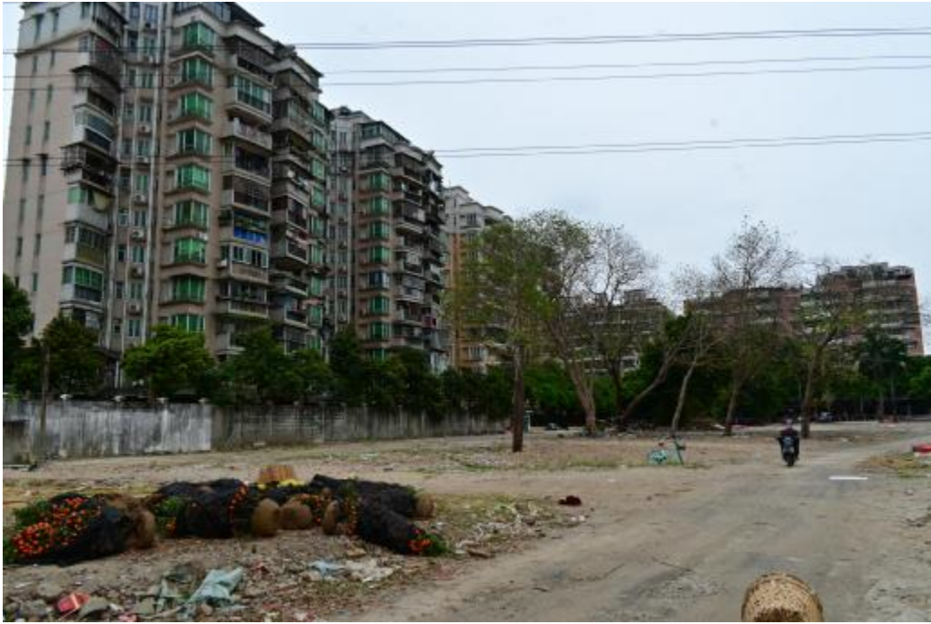
图 14 地块内北部现状（北-南）