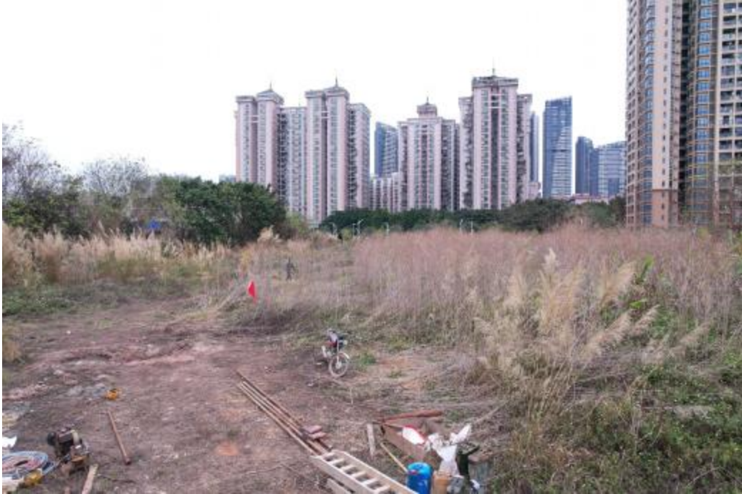
图 23 地块内北部现状（西-东）