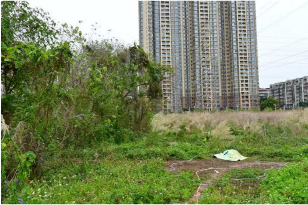
图 22 地块内北部现状（西-东）