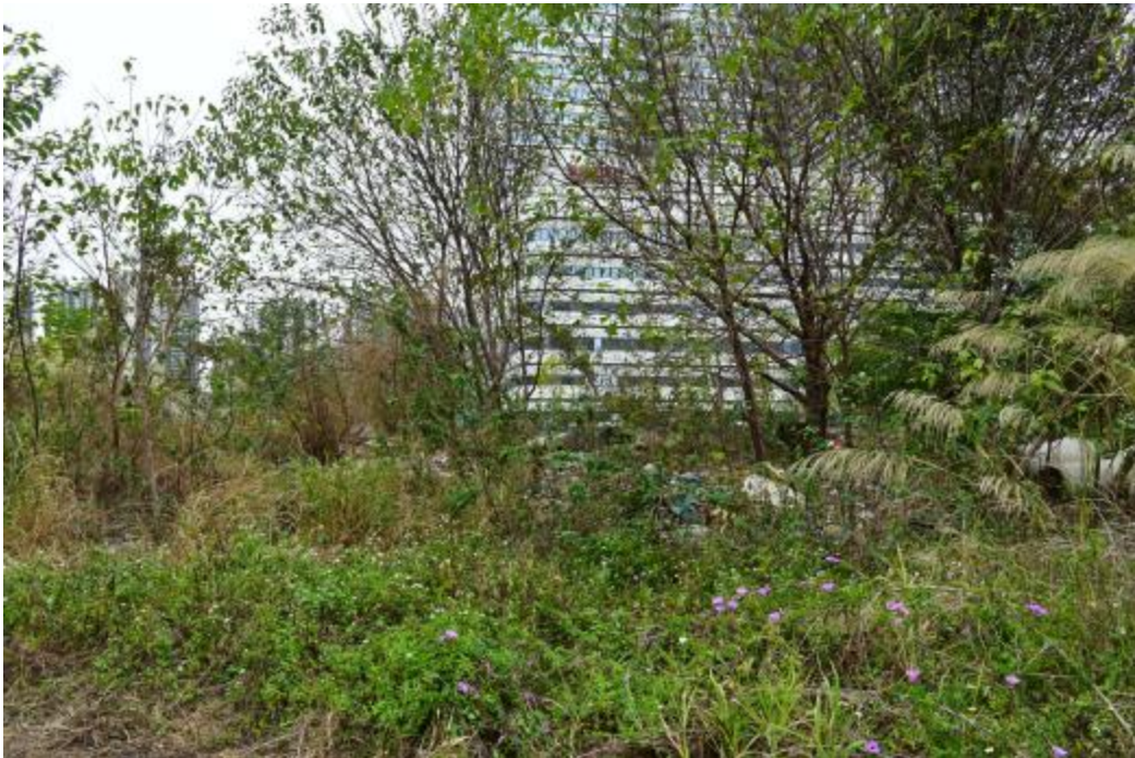
图 17 地块内西北部现状（东-西）