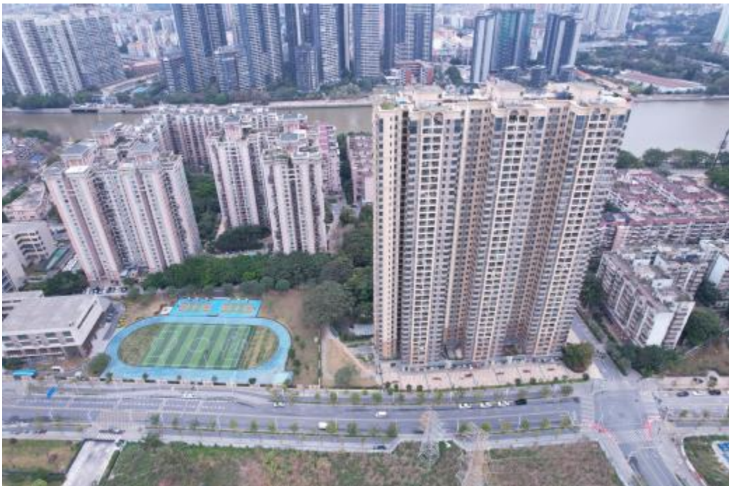
图 11 地块外西部地形地貌航拍图（西-东）