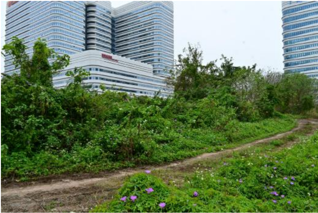
图 18 地块内西部现状（东南-西北）