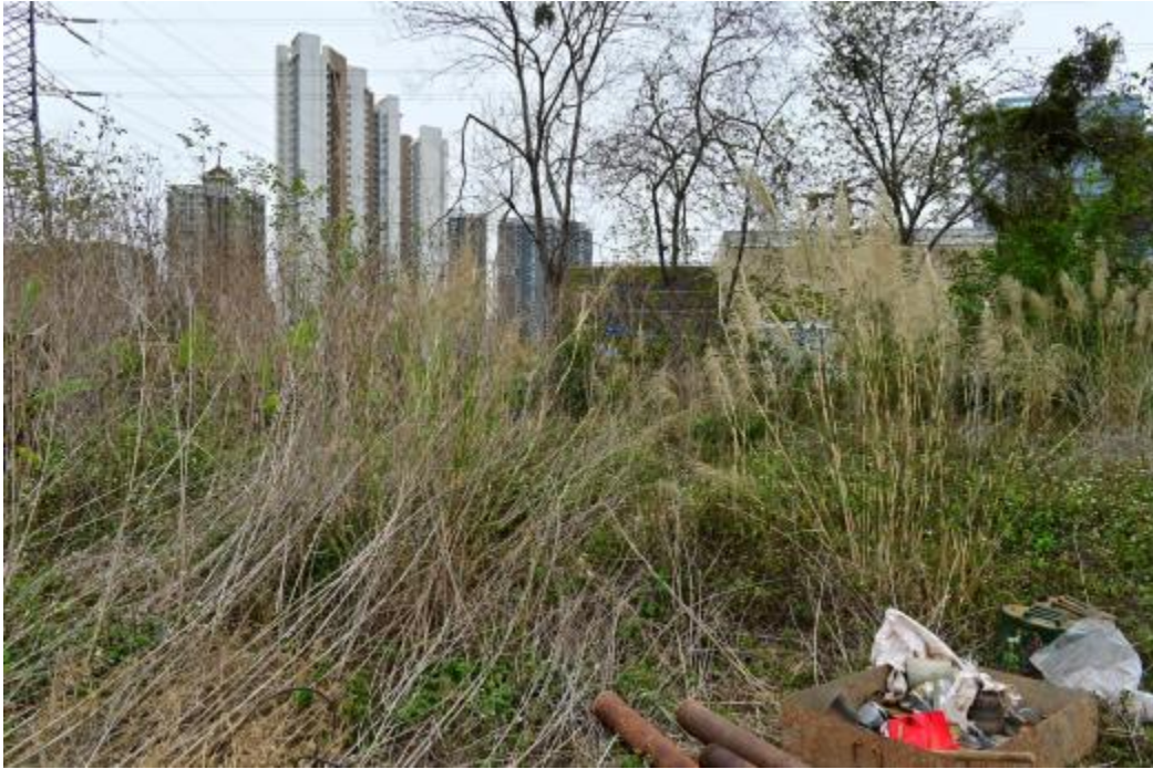
图 16 地块内北部现状（北-南）