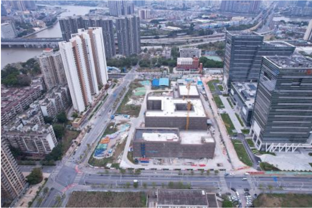
图 8 地块外北部地形地貌航拍图（北-南）