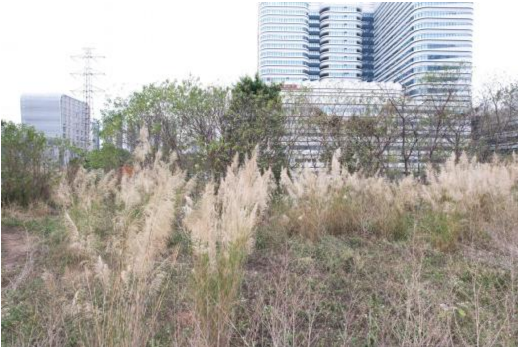
图 13 地块内西部现状（东-西）