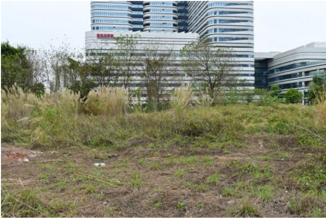
图 12 地块内西部现状（东-西）