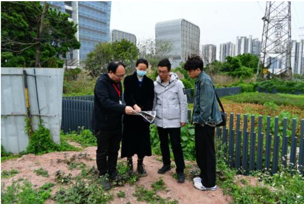
图 5 工作人员确认地块范围（东北-西南）