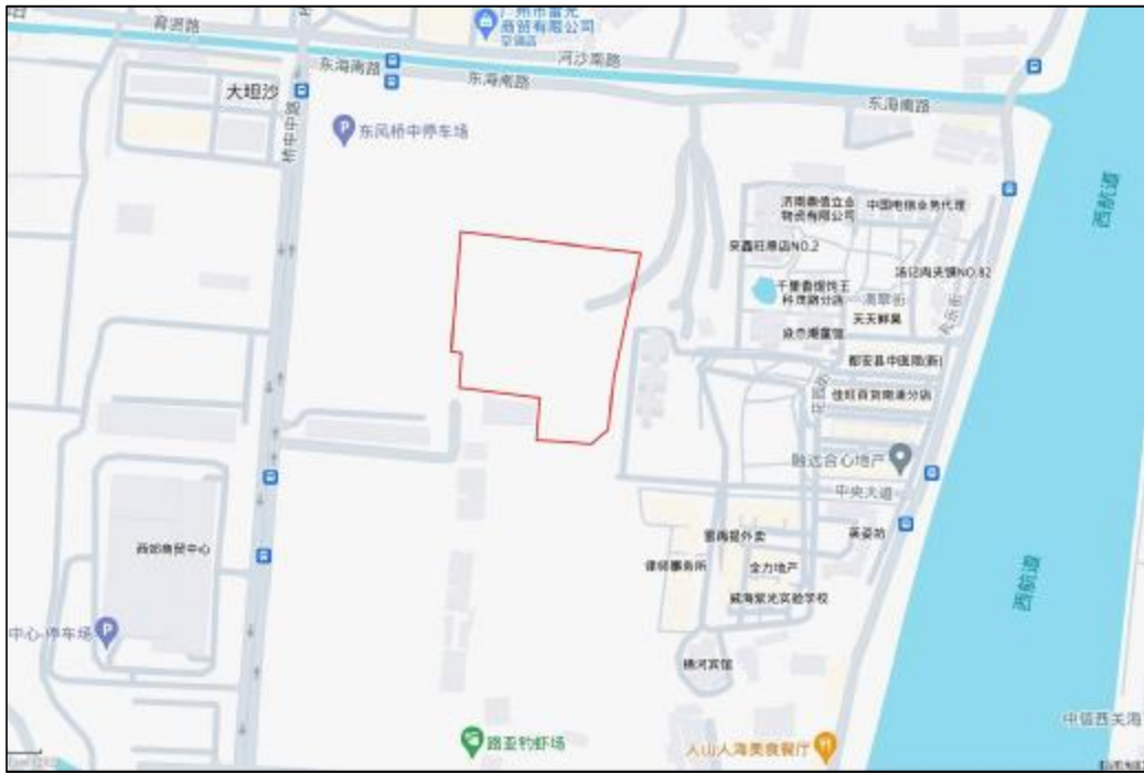
图 3 项目工程周边环境示意图（奥维地图）