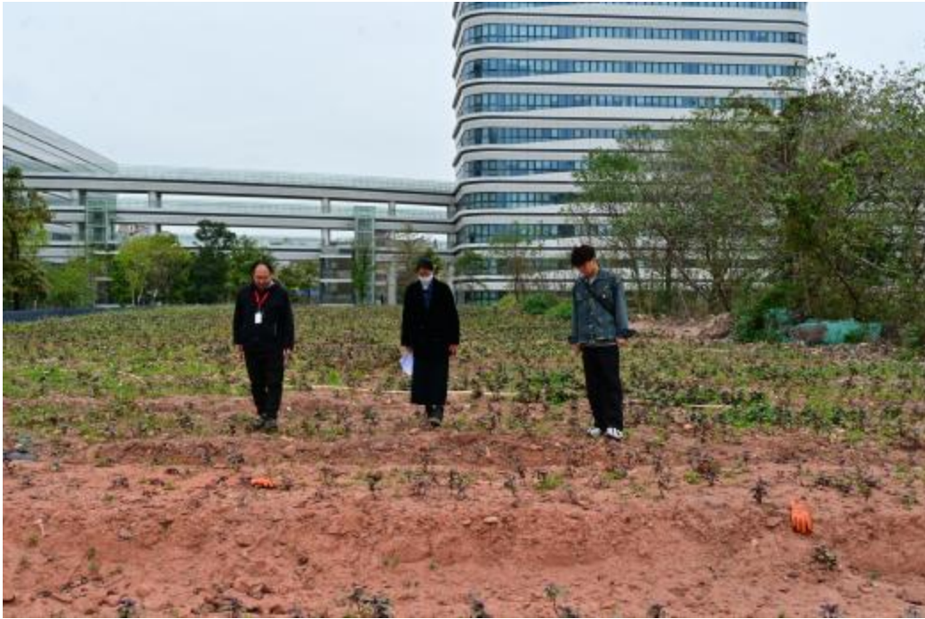
图 6 对地块地表进行现场踏查（南-北）