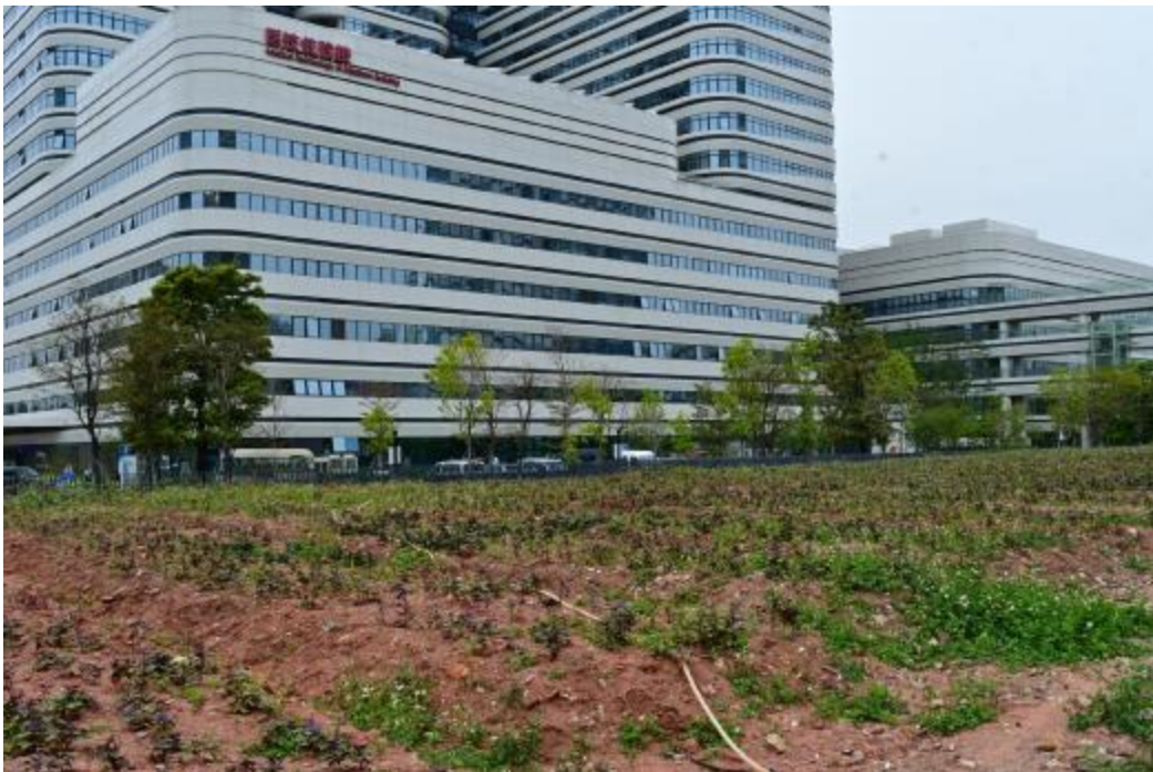
图 19 地块内西部现状（东南-西北）