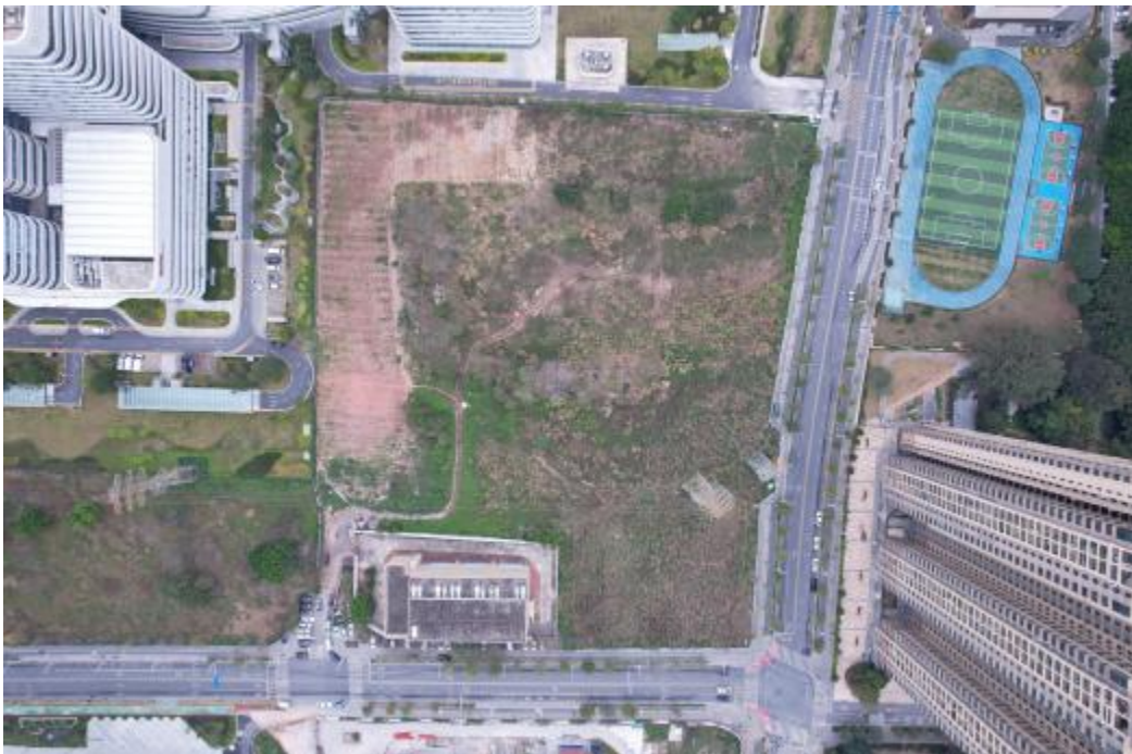
图 7 地块全景航拍图（上北-下南）