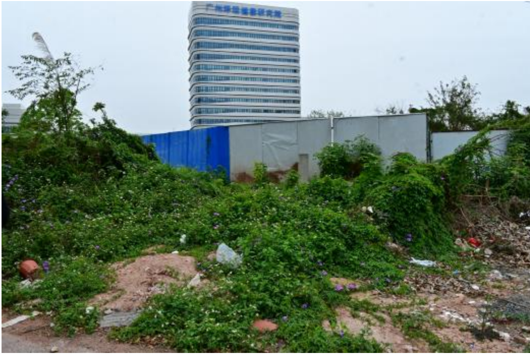
图 20 地块内西北部现状（南-北）