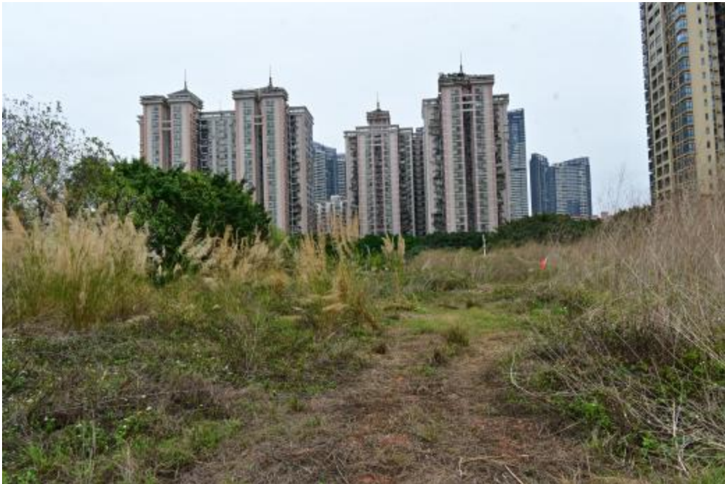
图 21 地块内北部现状（西-东）