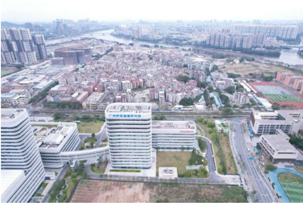
图 10 地块外南部地形地貌航拍图（南-北）