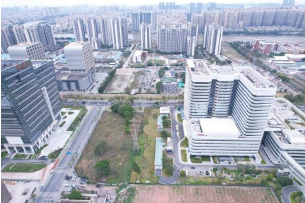
图 9 地块外东部地形地貌航拍图（东-西）