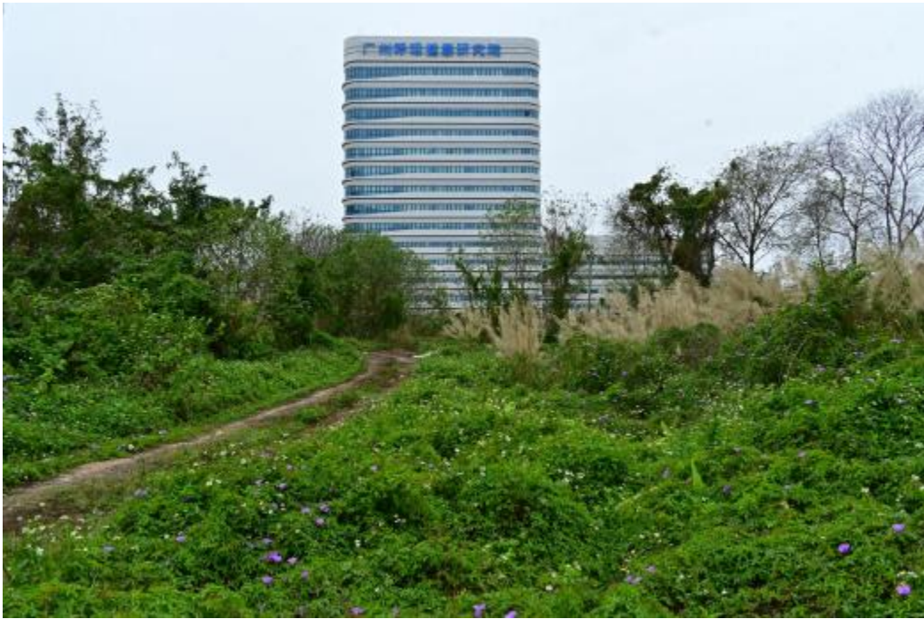
图 14 地块内北部现状（南-北）