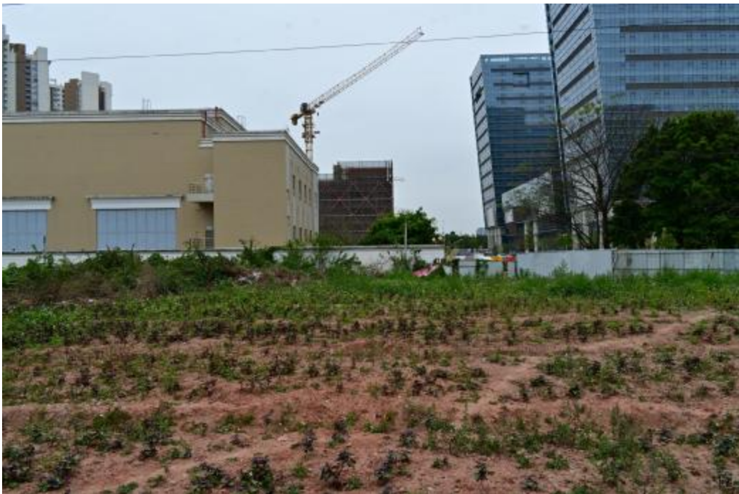
图 15 地块内东部现状（北-南）