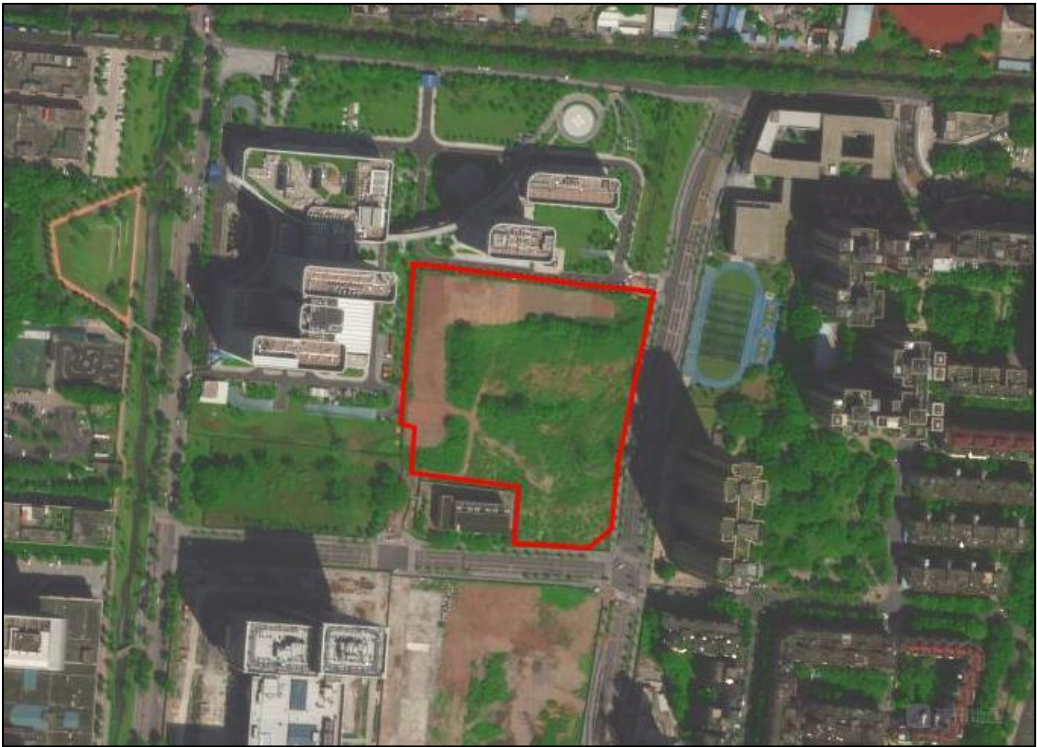
图 4 项目工程红线图（奥维地图）