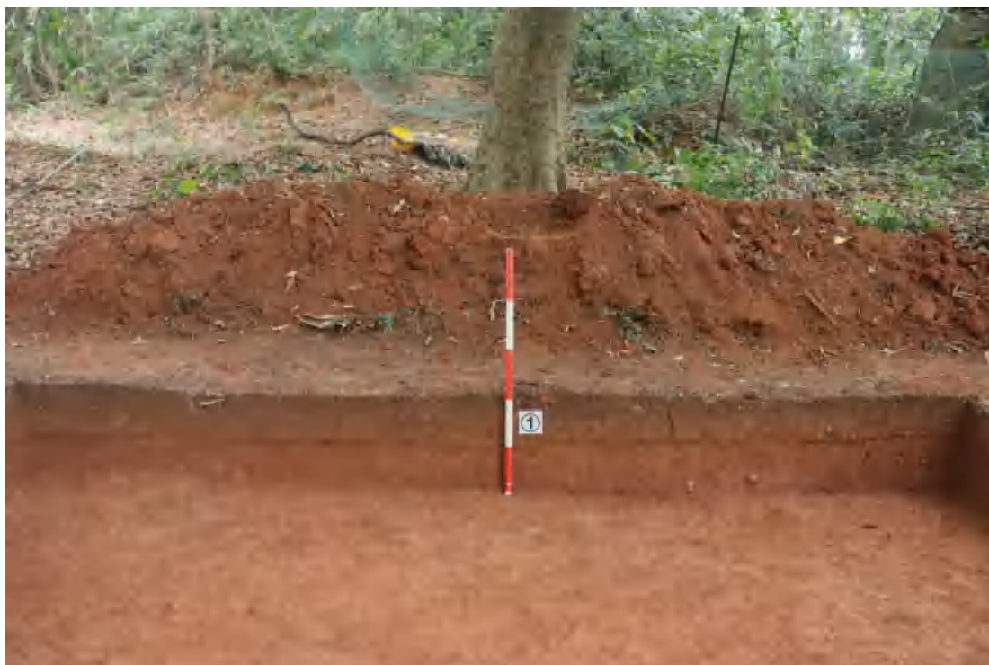
图 65 西壁剖面（东-西）