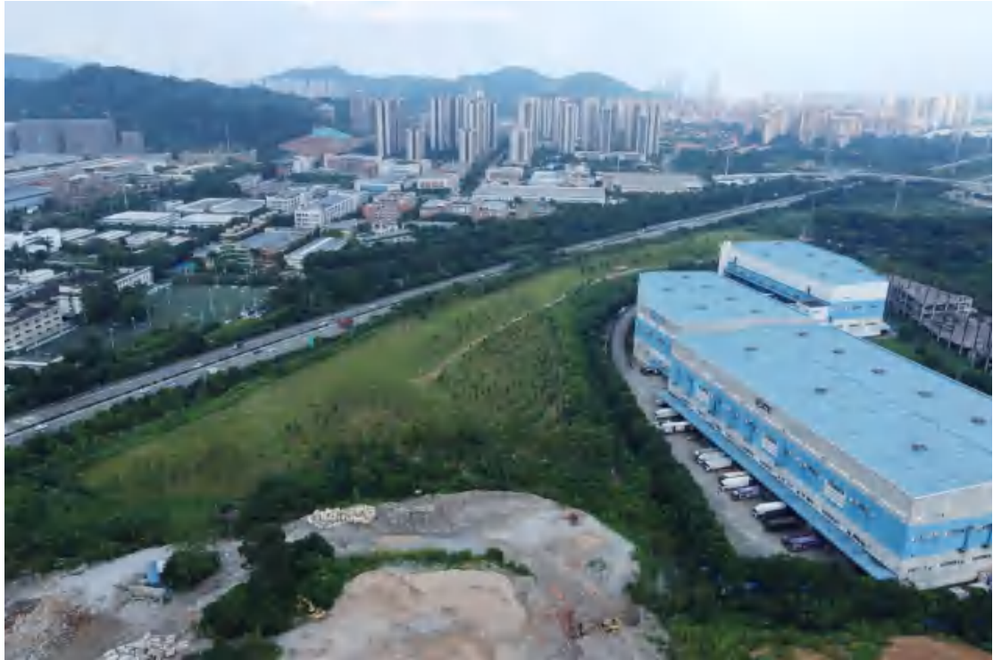
图 9 地块外东部现状（西-东）