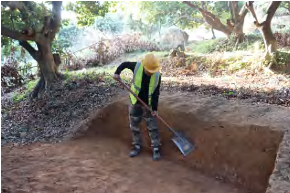
图 45 修整剖面（东南-西北）