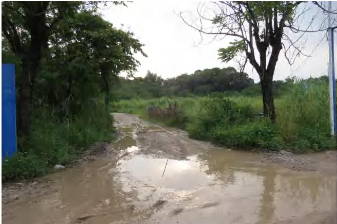
图 12 地块内北部现状（东-西）