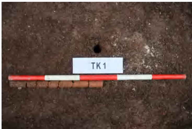
图 34 TK1 土样 (一米标杆,土样由左往右)

①层: 表土层,深 0-0.2 米,厚 0.2 米,为灰褐色黏土,土质疏松,内含植物根系、砂砾等。以下为红褐色黏土,土质致密,纯净,系生土。