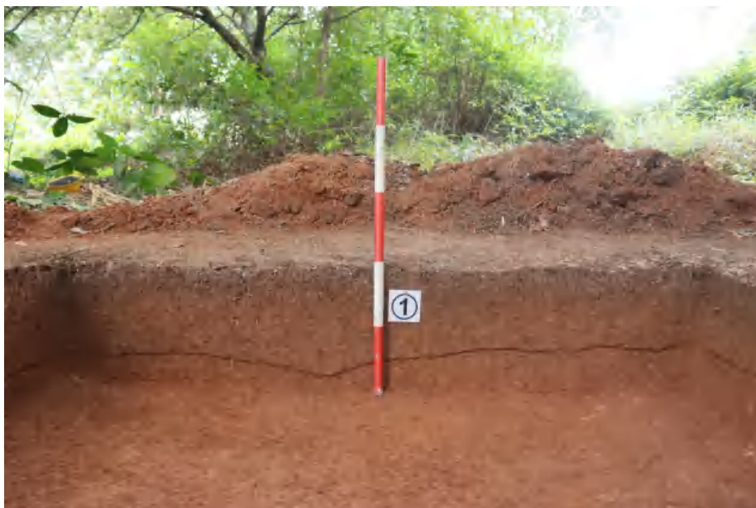
图 64 南壁剖面（北-南）