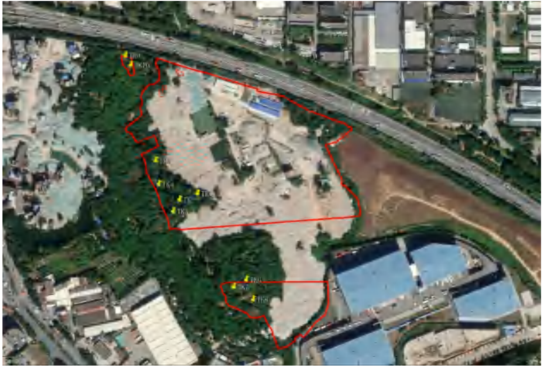
图 26 标准探孔分布示意图（黄色标记点）