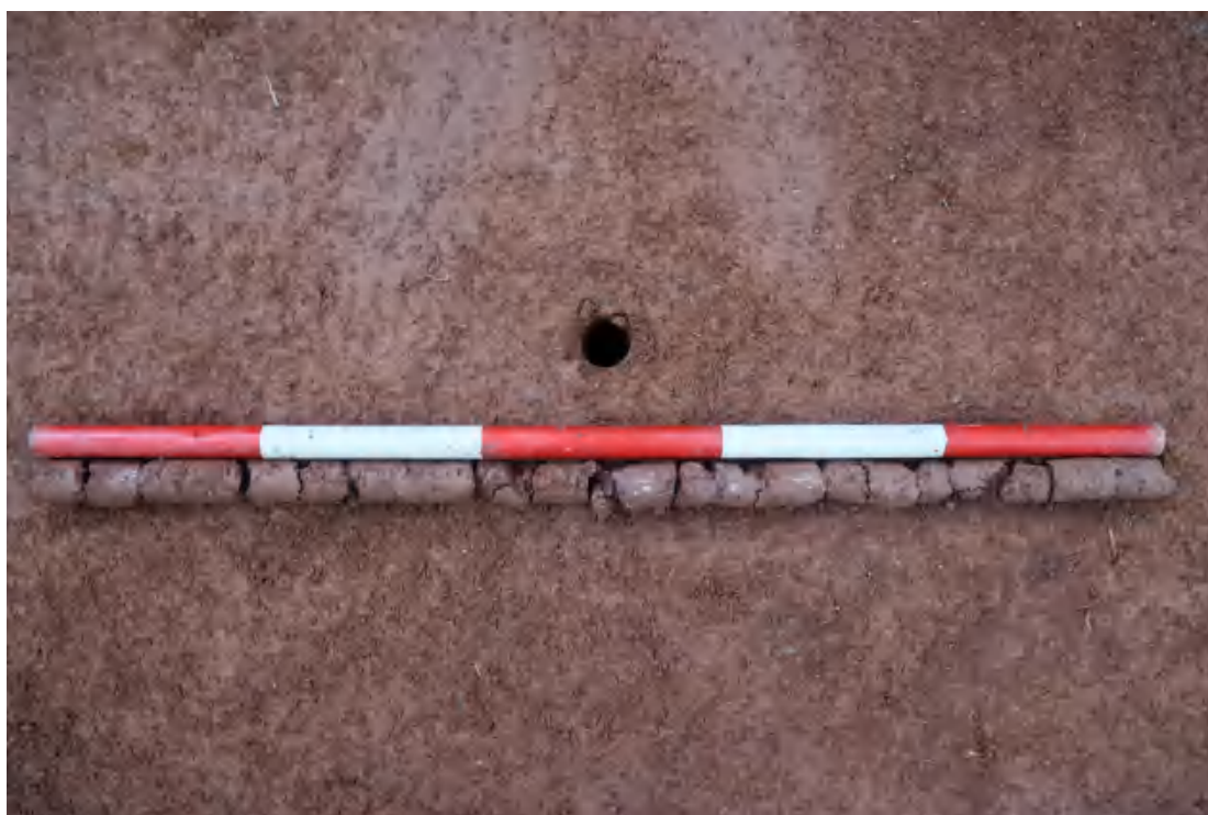
图 66 探沟底部土样（一米标尺, 土样由左到右）