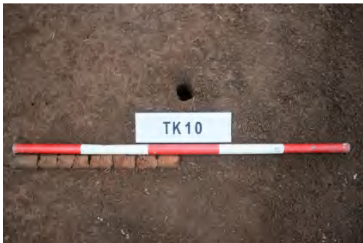
图 43 TK10 土样（一米标杆，土样由左往右）

①层：表土层，深 0-0.12 米，厚 0.12 米，为灰褐色黏土，土质疏松，内含植物根系、砂砾等。以下为红褐色黏土，土质致密，纯净，系生土。