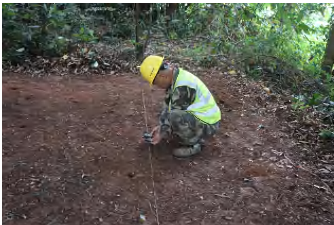
图 52 罗盘定向（南-北）