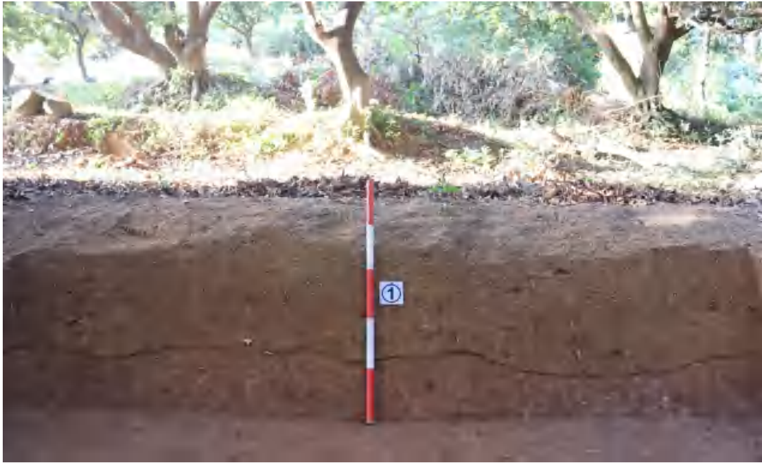
图 48 DM1 调整后全景照

①层：表土层，厚0.38-0.51米，为灰褐色黏土，土质疏松，内含植物根系。以下为红褐色黏土，土质致密、纯净，系生土。