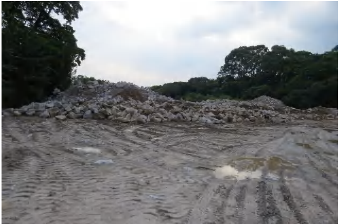
图 22 地块内中部现状（东-西）