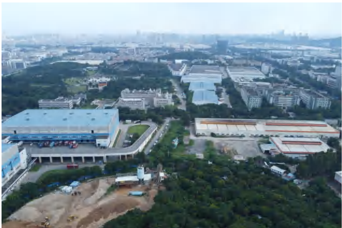
图 10 地块外南部现状（北-南）