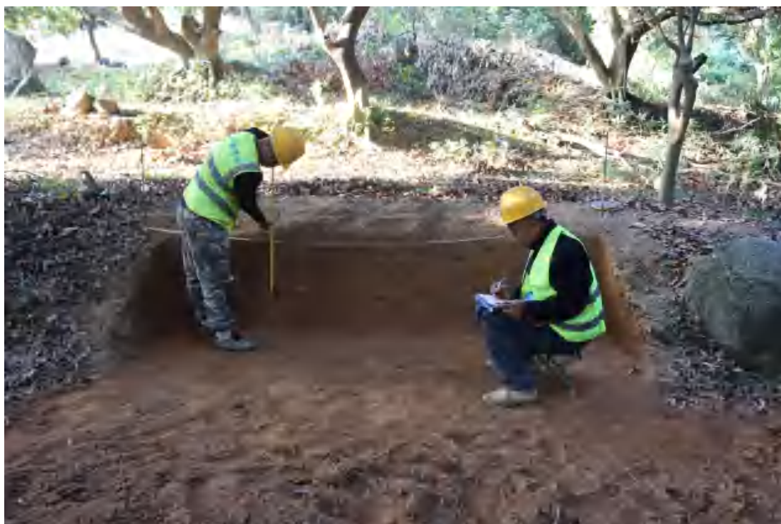
图 47 现场绘图（南-北）