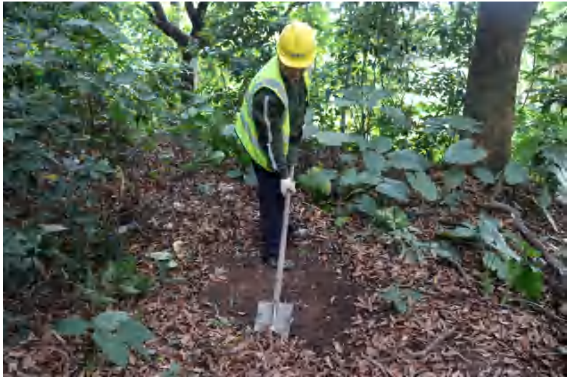
图 31 清表（南-北）