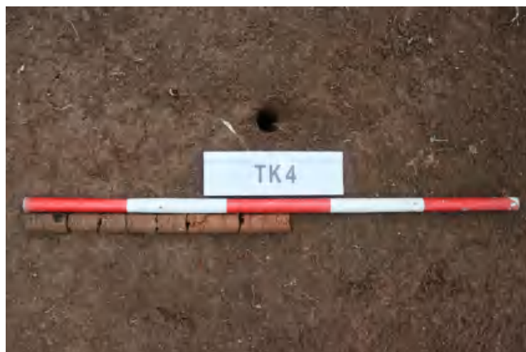
图 37 TK4 土样 (一米标杆,土样由左往右)

①层: 表土层,深 0-0.3 米,厚 0.3 米,为灰褐色黏土,土质疏松,内含植物根系、砂砾等。以下为红褐色黏土,土质致密,纯净,系生土。