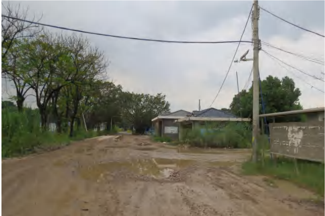
图 13 地块内北部现状（南-北）