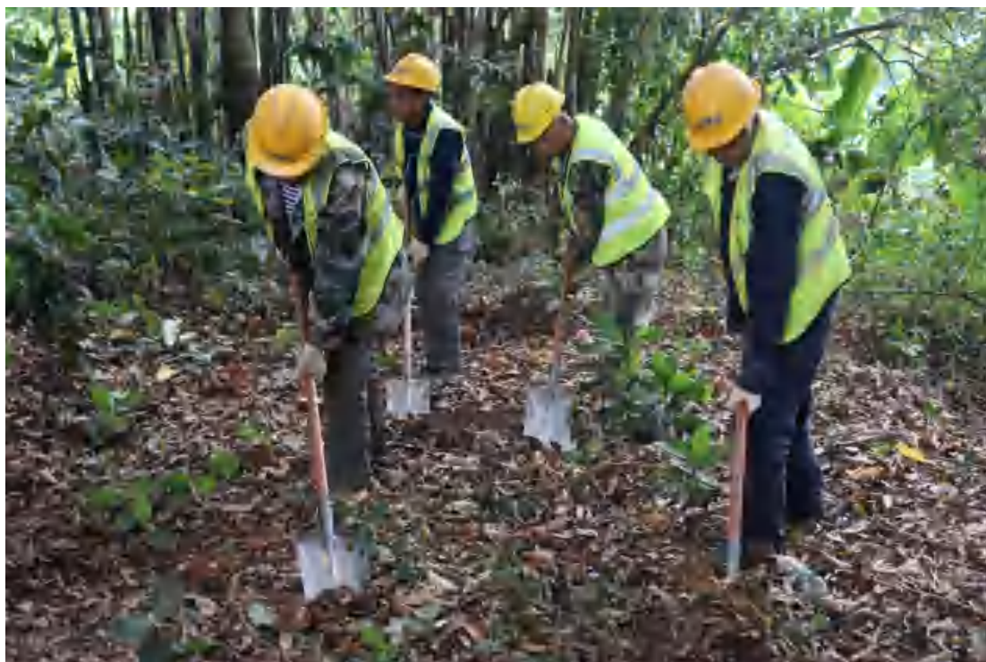
图 51 清表工作照（南-北）