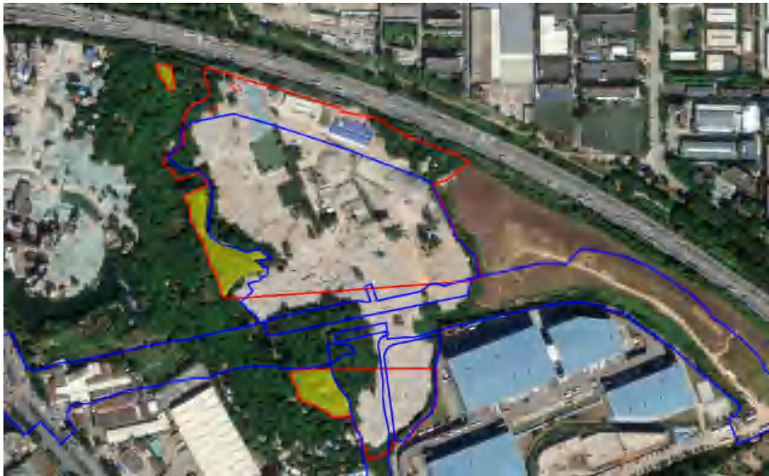
图 25 勘探区域分布示意图（黄色范围为勘探区域，蓝色范围为以往考古范围）

通过对黄埔区云埔街道刘村社区岗贝村旧村改造项目的考古调查，我院初步掌握了该项目的基本情况。该项目总面积约为 161000 平方米，项目范围内山岗区域大部分已经完成过考古工作。对未做过考古工作的区域进行考古勘探工作，勘探面积 10000 平方米，此次勘探布设探孔约 8800 个。现选取标准探孔 10 个，编号分别为 TK1-TK10，具体情况如下：