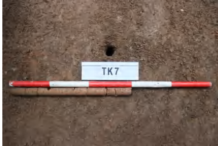
图 40 TK7 土样（一米标杆，土样由左往右）

①层：表土层，深 0-0.08 米，厚 0.08 米，为灰褐色黏土，土质疏松，内含 植物根系、砂砾等。以下为红褐色黏土，土质致密，纯净，系生土。