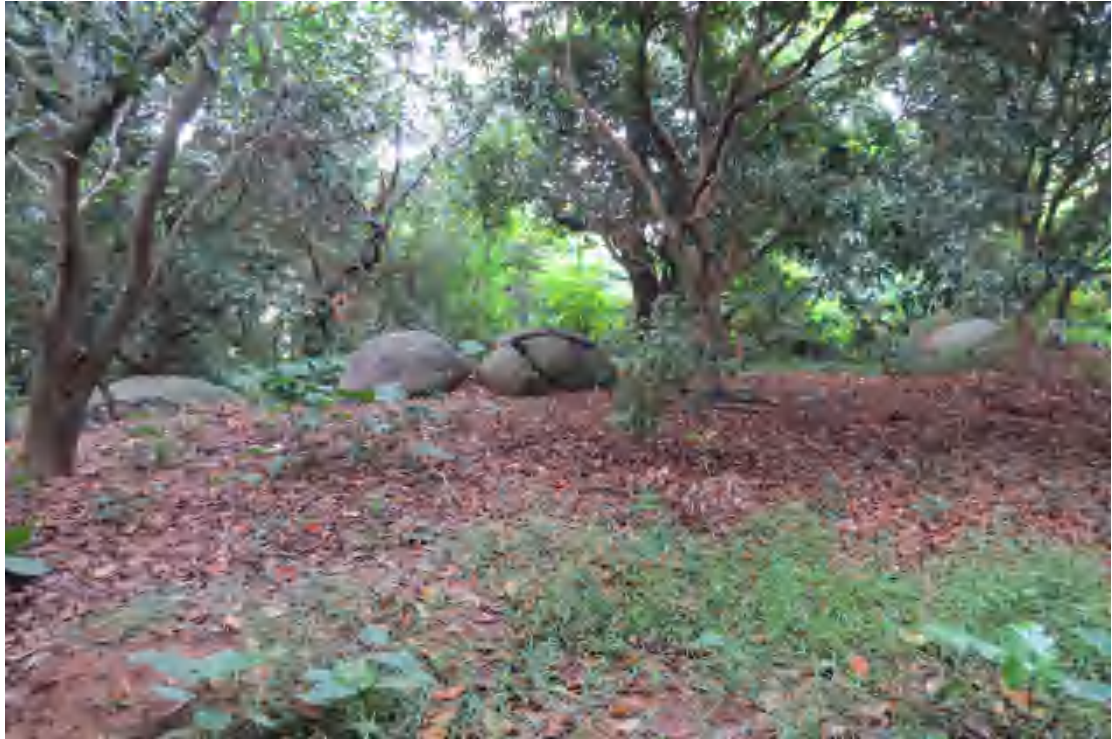
图 17 地块内南部现状（南-北）