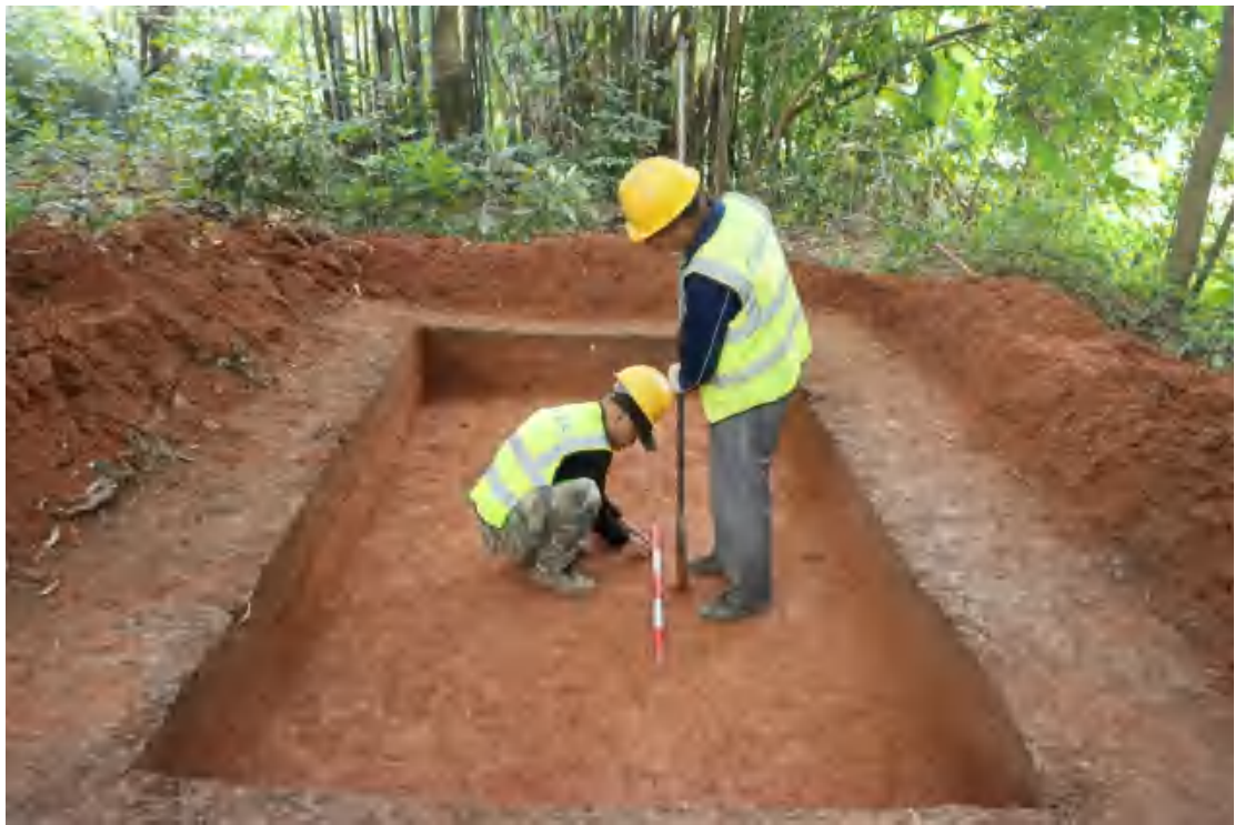
图 60 提取探沟底部土样（南-北）