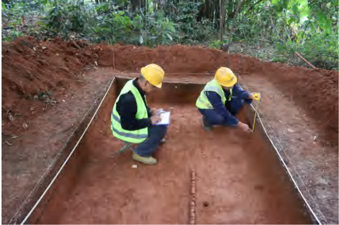
图 59 现场绘图（南-北）