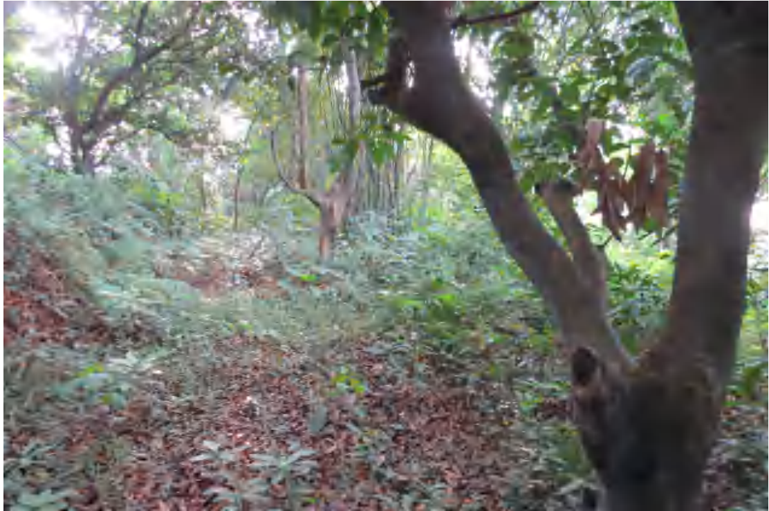
图 19 地块内南部现状（东-西）