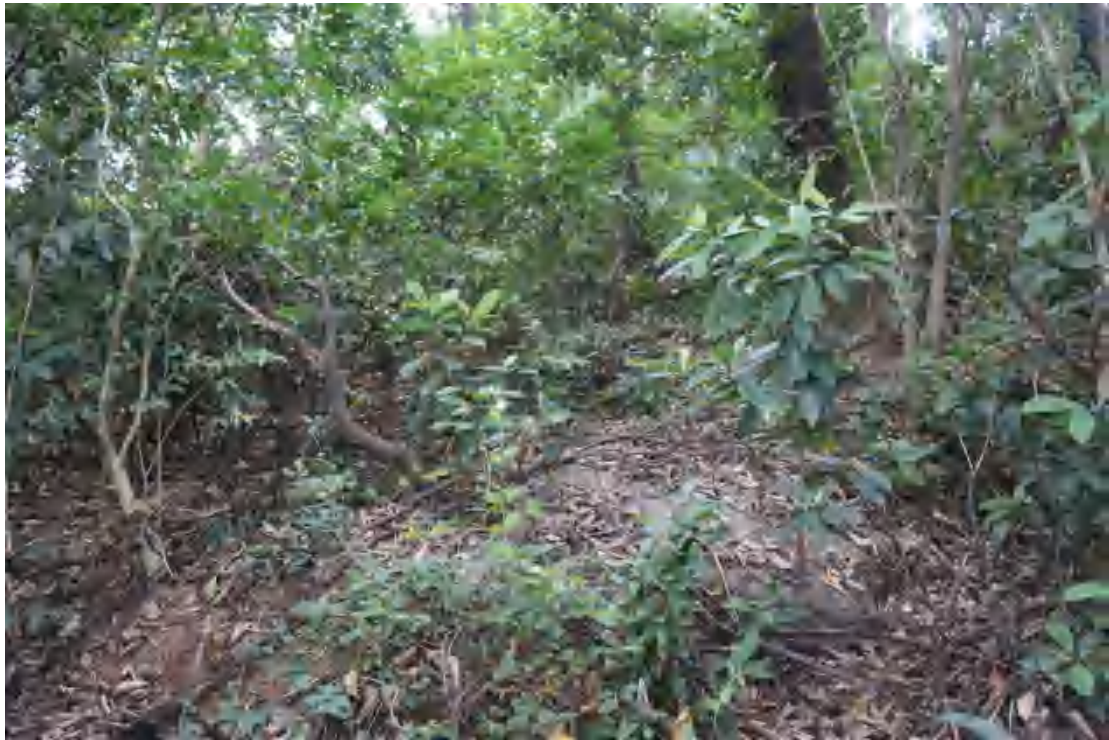
图 27 勘探区域现状（北-南）