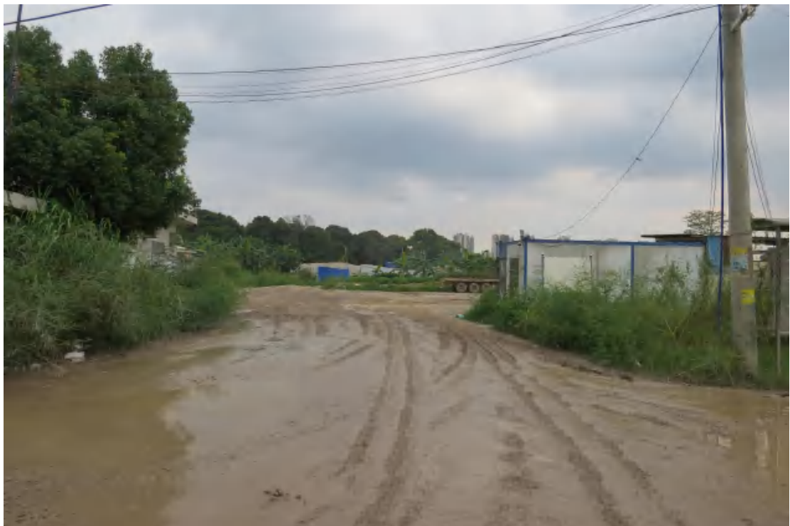
图 14 地块内北部现状（西-东）