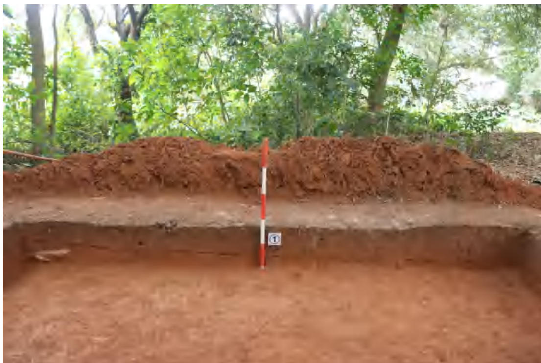
图 63 东壁剖面（西-东）