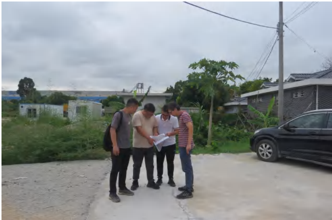
图 6 工作人员确认地块范围（东-西）

此次考古调查不足以全面反映地块内的文物埋藏情况。结合周边考古成果，为确认该地块范围内的文物埋藏情况，需对该地块作进一步的考古勘探。