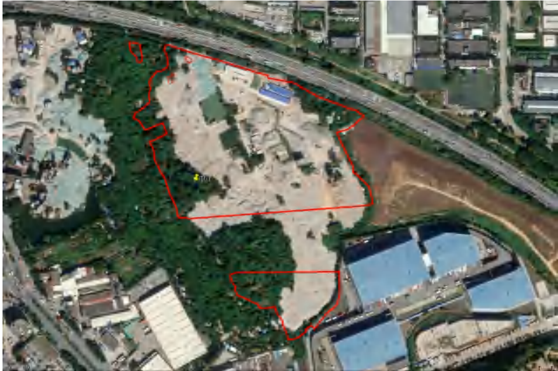
图 50 探沟分布示意图（绿色标记点）

根据实际情况，结合探孔勘探的结果，我们还以布设探沟的方式进行考古勘探工作，以便进一步了解地块内地层堆积情况。我们在该地块探区内布置探沟 1 条，编号 TG1，具体情况如下：