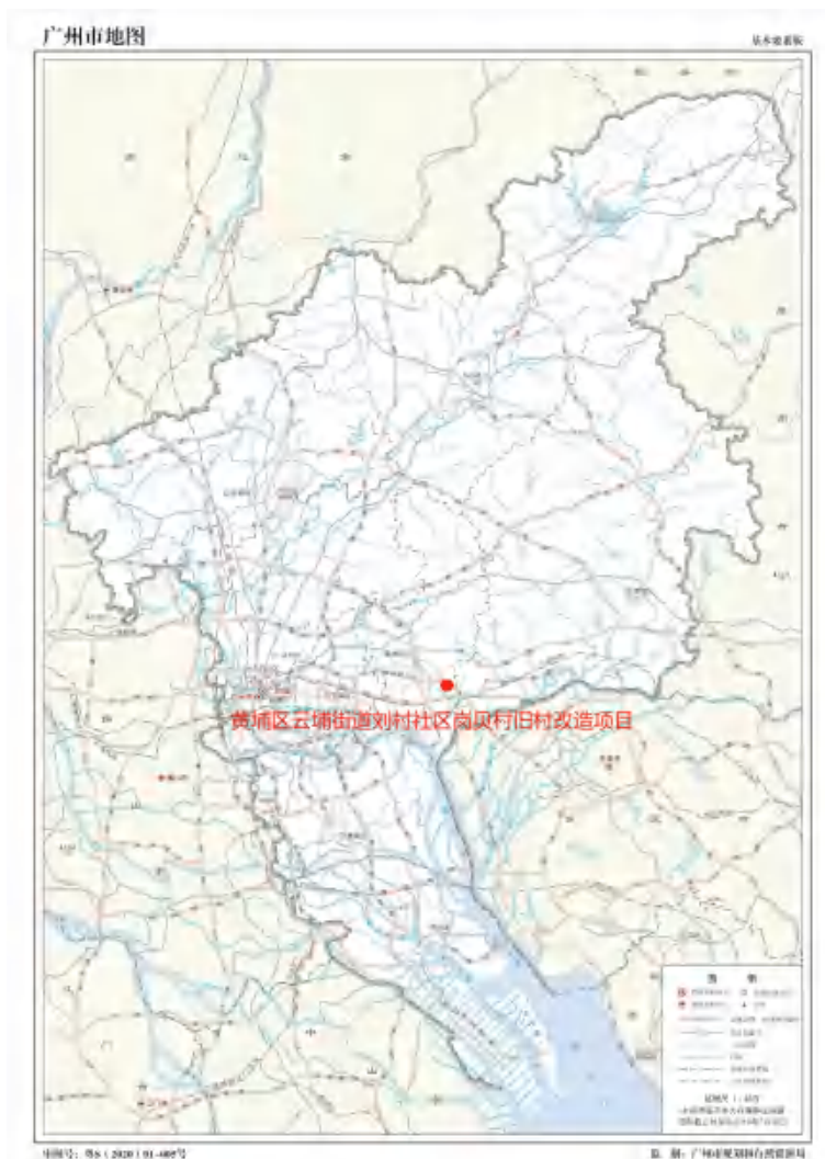
图 1 项目在广州市位置示意图（广州市规划和自然资源局）

根据《中华人民共和国文物保护法》《广州市文物保护规定》，按照《广州市文物局关于黄埔区云埔街道刘村社区岗贝村旧村改造项目考古调查勘探工作的复函》(文物 2023911 号)指导意见，受广州市黄埔区云埔街刘村社区经济联合社委托，由我院负责对该项目的考古调查勘探工作。