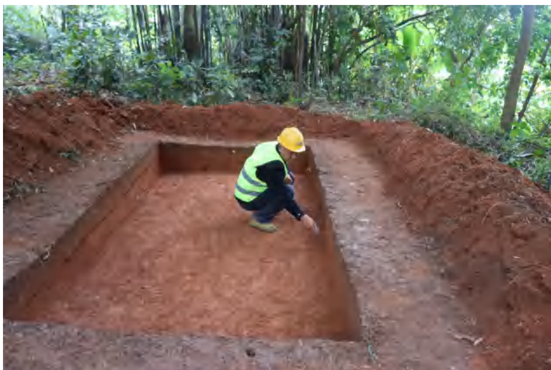
图 58 划分地层线（南-北）