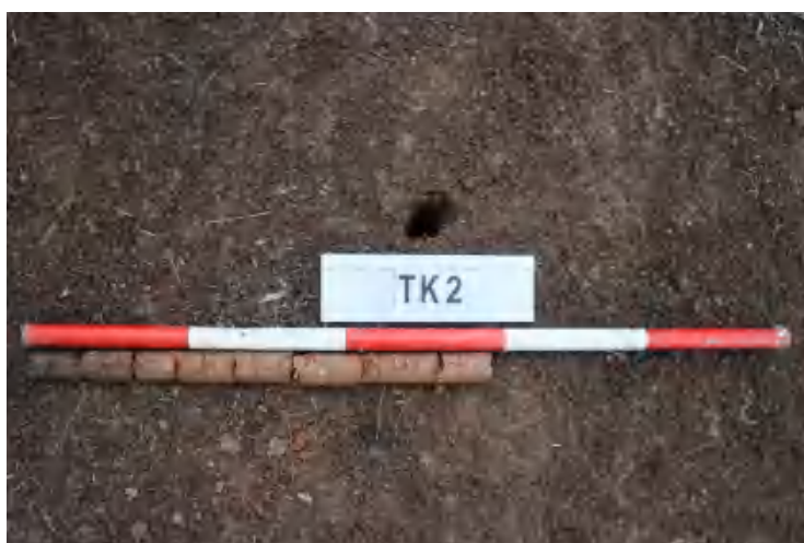
图 35 TK2 土样 (一米标杆,土样由左往右)

①层: 表土层,深 0-0.15 米,厚 0.15 米,为灰褐色黏土,土质疏松,内含植物根系、砂砾等。以下为红褐色黏土,土质致密,纯净,系生土。