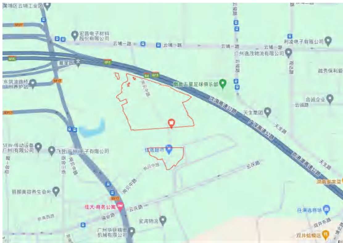
图 3 项目红线及周边环境示意图（奥维地图）