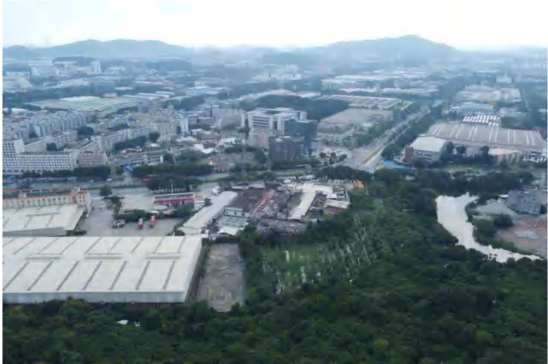
图 11 地块外西部现状（东-西）