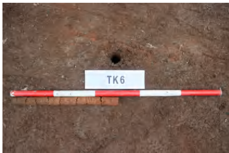
图 39 TK6 土样 (一米标杆, 土样由左往右)

①层: 表土层,深 0-0.15 米,厚 0.15 米,为灰褐色黏土,土质疏松,内含植物根系、砂砾等。以下为红褐色黏土,土质致密,纯净,系生土。