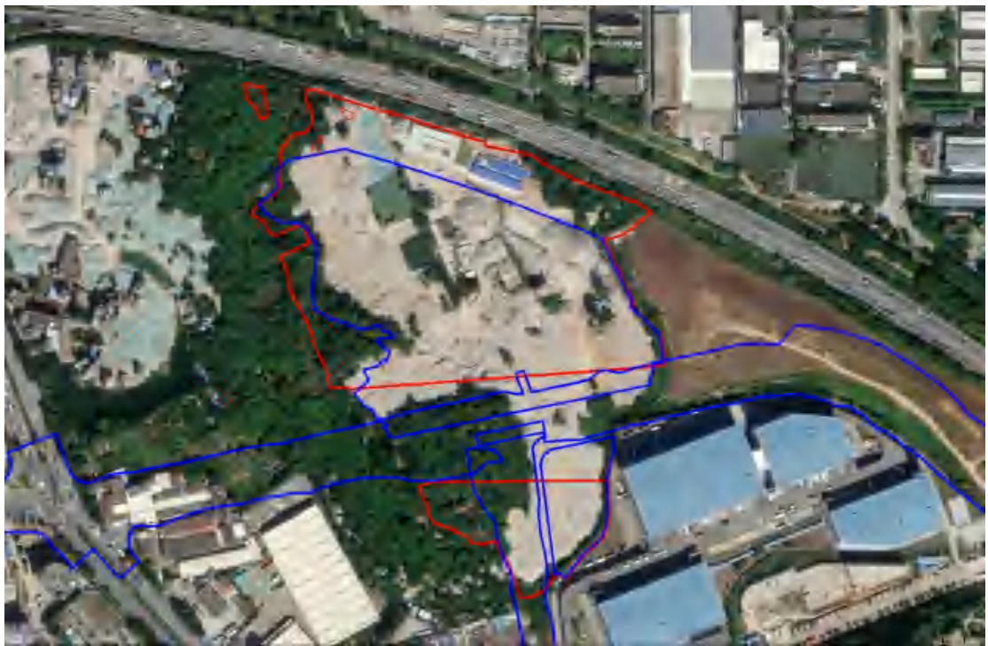
图 5 项目工程卫星红线图(红色范围为本次项目范围，蓝色范围为往年已做项目范围)