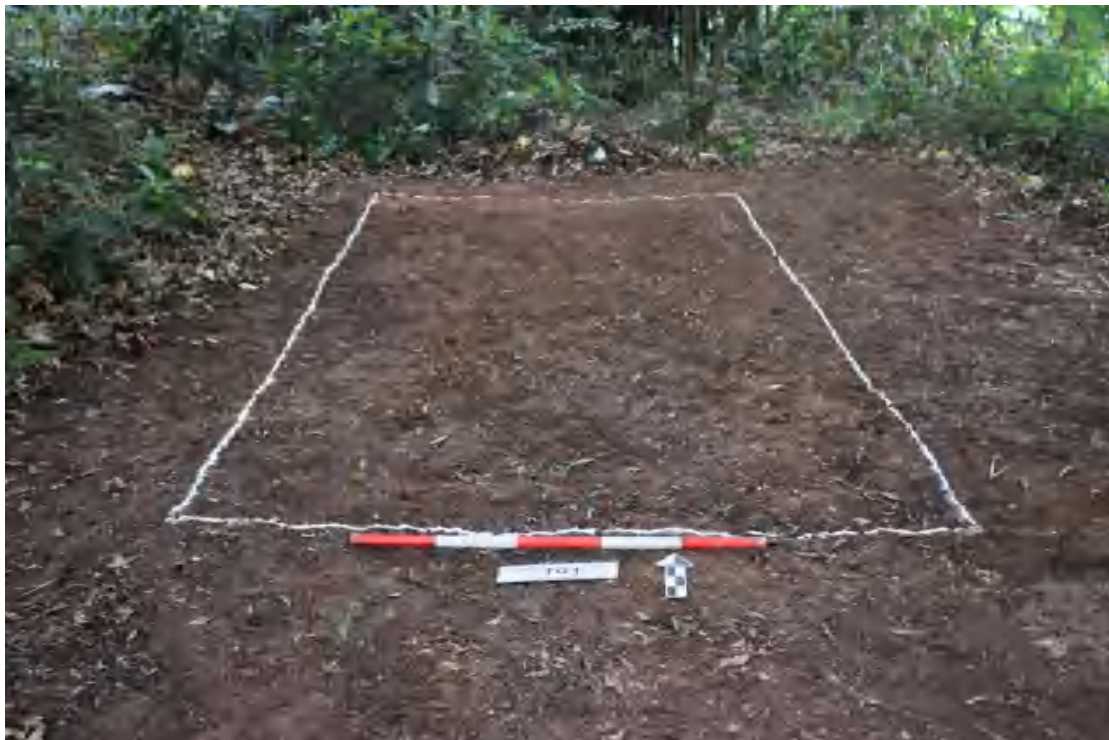
图 54 TG1 全景（南-北）