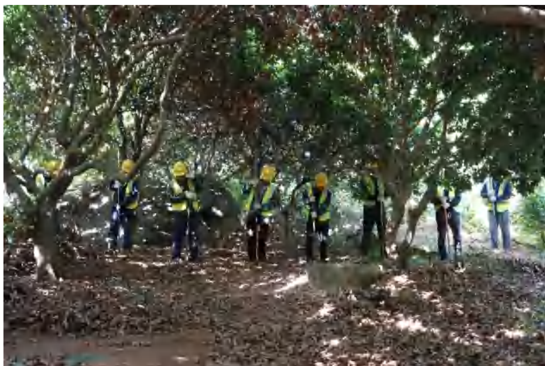
图 29 普探工作照（南-北）