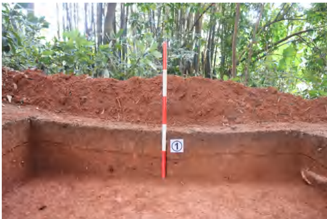
图 62 北壁剖面（南-北）