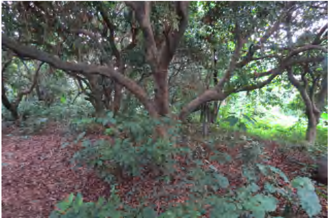
图 16 地块内南部现状（东-西）