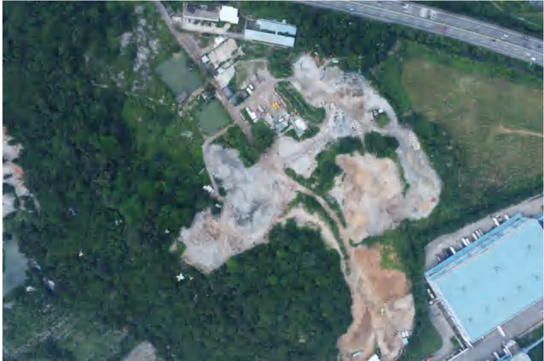
图 7 地块全景（上北-下南）