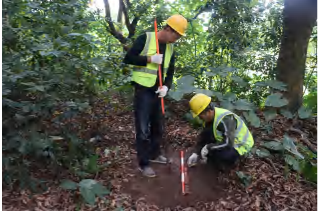
图 32 提取土样（南-北）