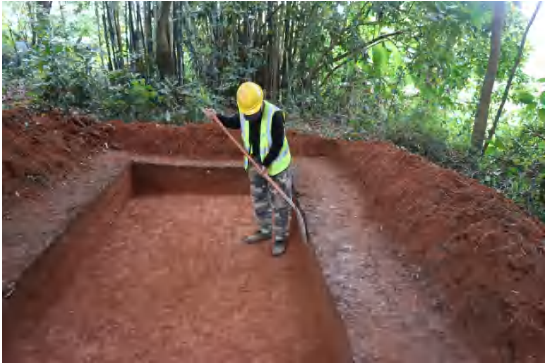
图 56 修整探沟壁（南-北）