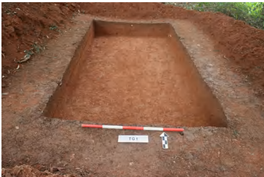
图 61 清理完成后全景（南-北）