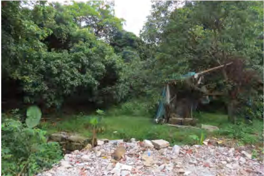
图 21 地块内中部现状（北-南）