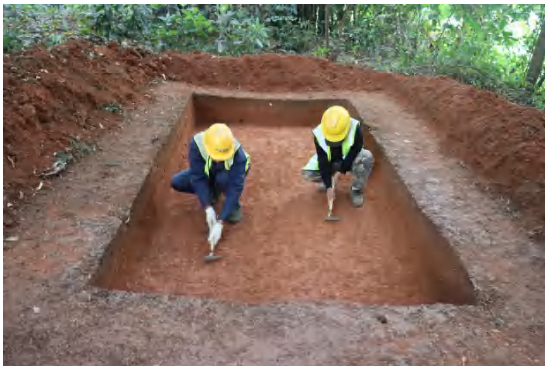
图 57 刮面（南-北）