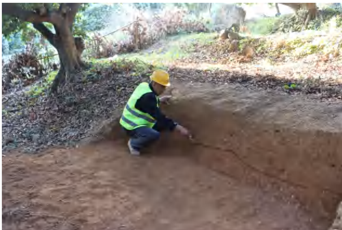
图 46 划分地层（东南-西北）