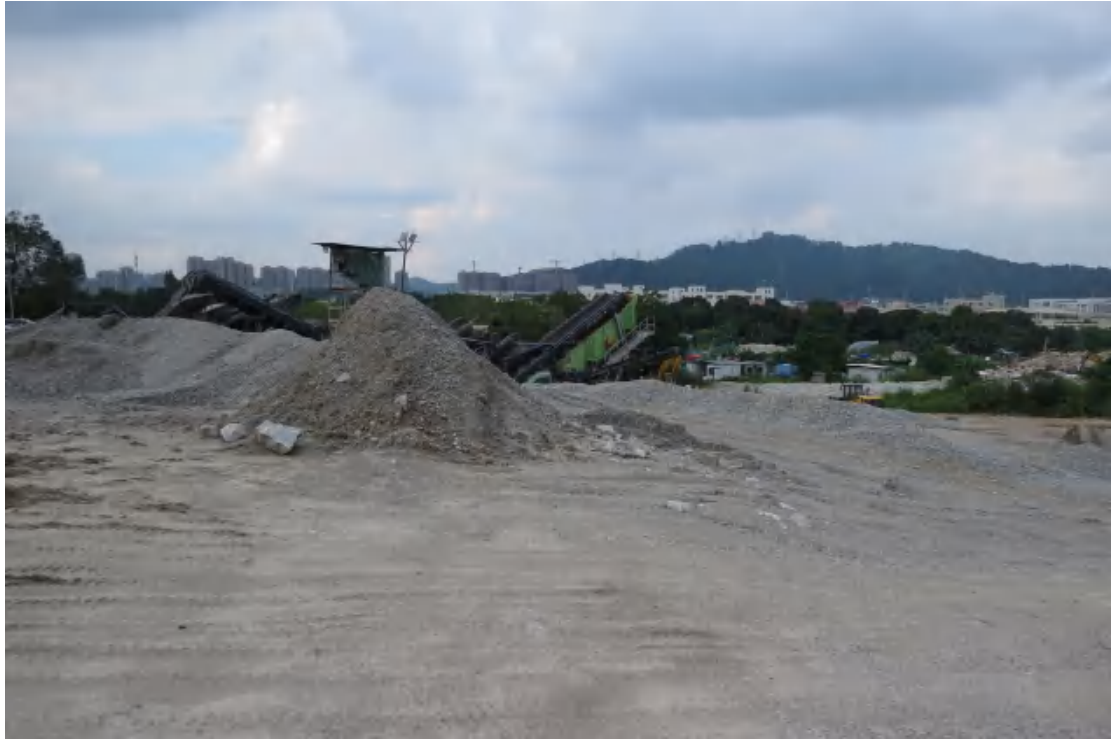
图 23 地块内中部现状（南-北）