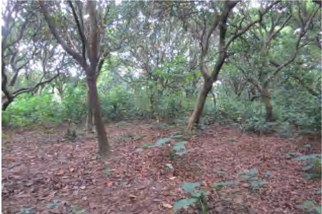
图 15 地块内南部现状（北-南）