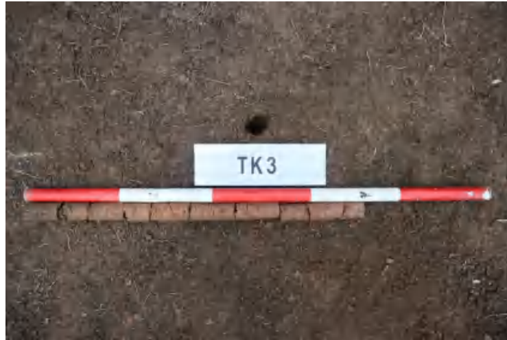
图 36 TK3 土样 (一米标杆,土样由左往右)

①层: 表土层,深 0-0.1 米,厚 0.1 米,为灰褐色黏土,土质疏松,内含植物根系、砂砾等。以下为红褐色黏土,土质致密,纯净,系生土。