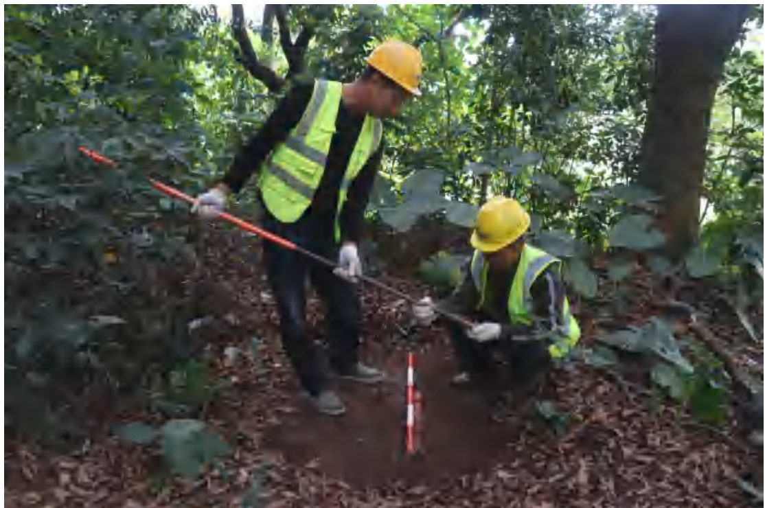
图 33 土样分析（南-北）