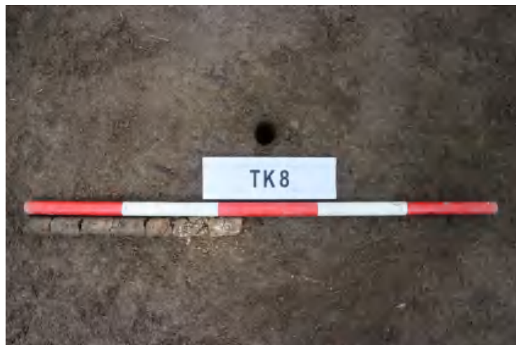
图 41 TK8 土样（一米标杆，土样由左往右）

①层：表土层，深 0-0.45 米，厚 0.45 米，为灰褐色黏土，土质疏松，内含 植物根系、砂砾等。以下有大石块，无法提取土样。