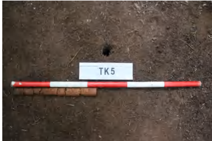
图 38 TK5 土样 (一米标杆, 土样由左往右)

①层: 表土层,深 0-0.2 米,厚 0.2 米,为灰褐色黏土,土质疏松,内含植物根系、砂砾等。以下为红褐色黏土,土质致密,纯净,系生土。