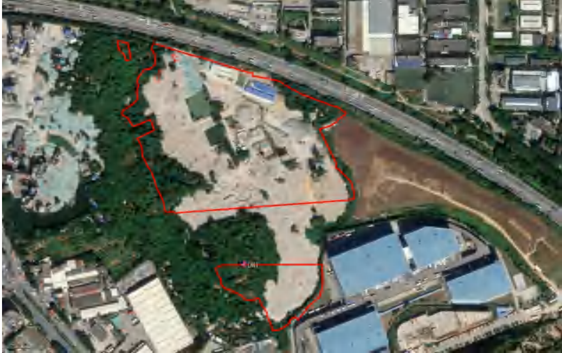
图 44 断面位置示意图(玫红色标记点)

为了进一步明确地块内地层堆积情况，我们在地块内修整断面 1 处，编号为 DM1，具体情况如下：