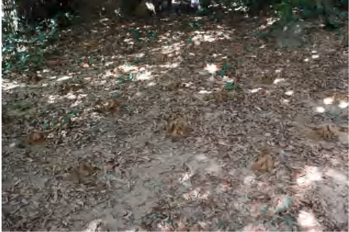
图 30 普探土样