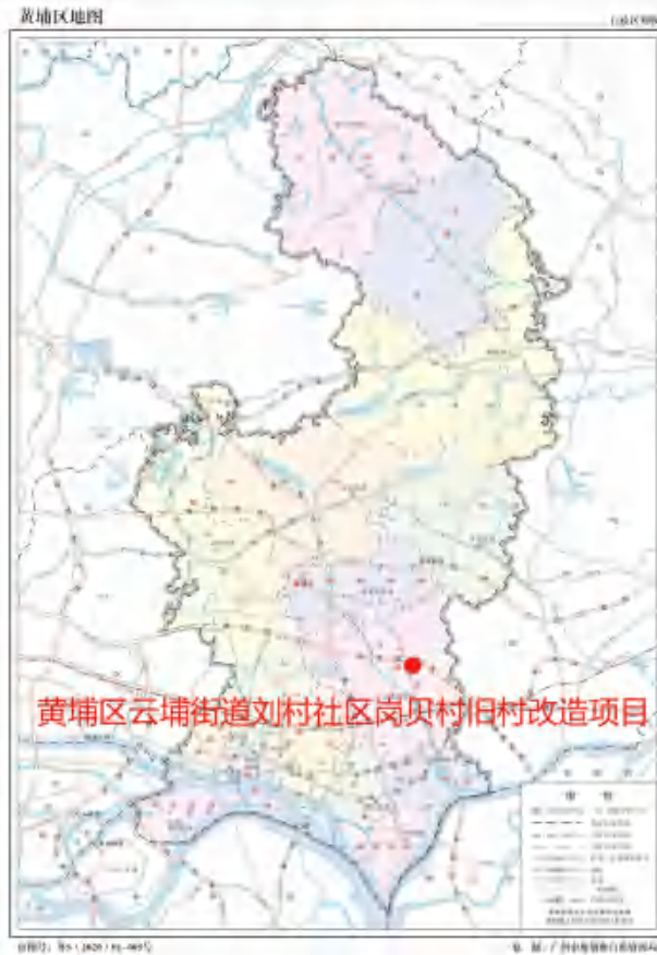
图 2 项目在黄埔区位置示意图（广州市规划和自然资源局）