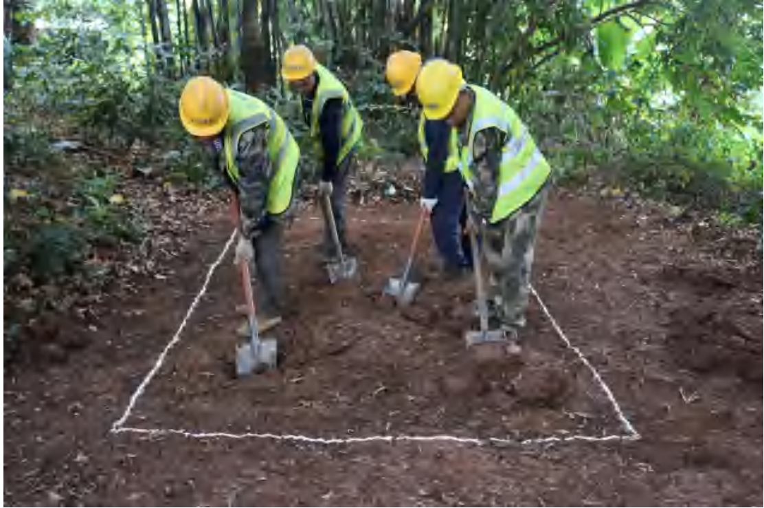
图 55 清理工作照（南-北）