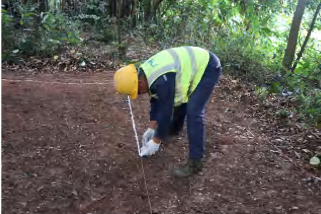
图 53 布设探沟（南-北）