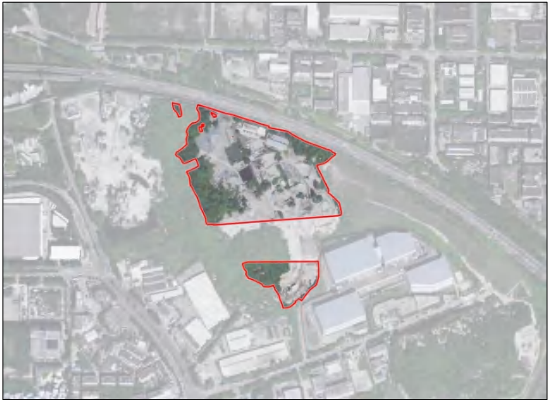
图 4 项目卫星红线图