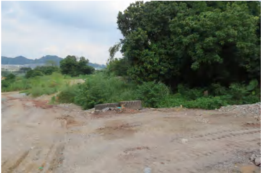
图 24 地块内中部现状（西-东）