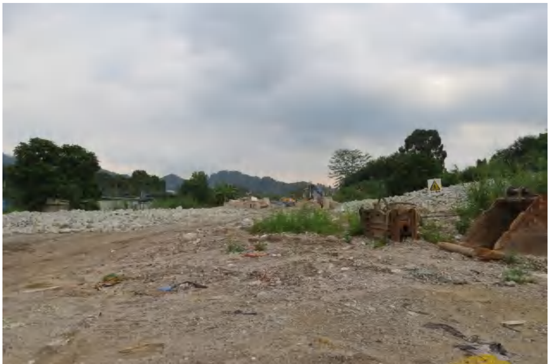
图 20 地块中部内现状（西-东）