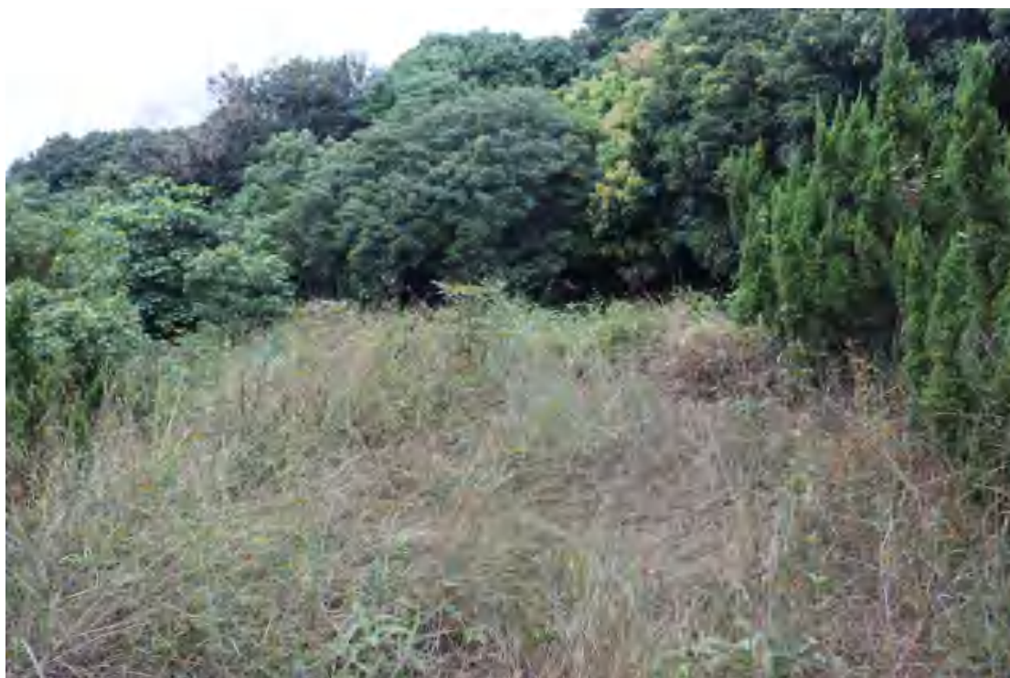
图 28 勘探区域现状（东-西）