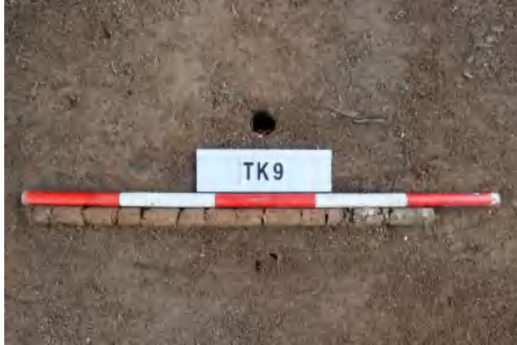
图 42 TK9 土样（一米标杆，土样由左往右）

①层：表土层，深 0-0.2 米，厚 0.2 米，为灰褐色黏土，土质疏松，内含植物根系、砂砾等。以下为红褐色风化土，土质致密，纯净，系生土。