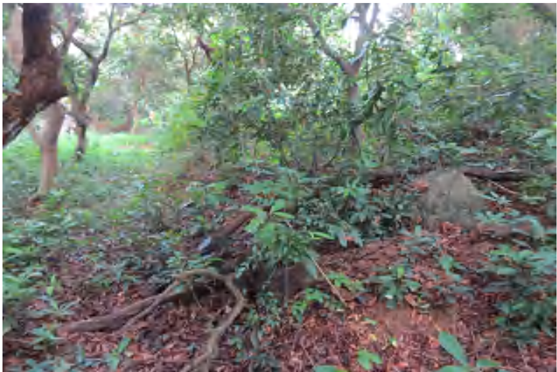
图 18 地块内南部现状（西-东）