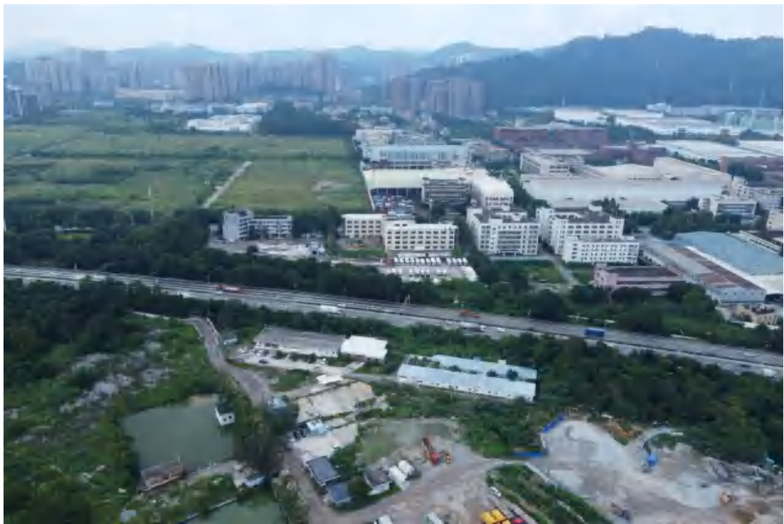
图 8 地块外北部现状（南-北）