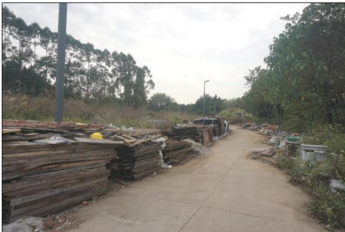
图 18 AH070738地块北部地貌照（北-南）