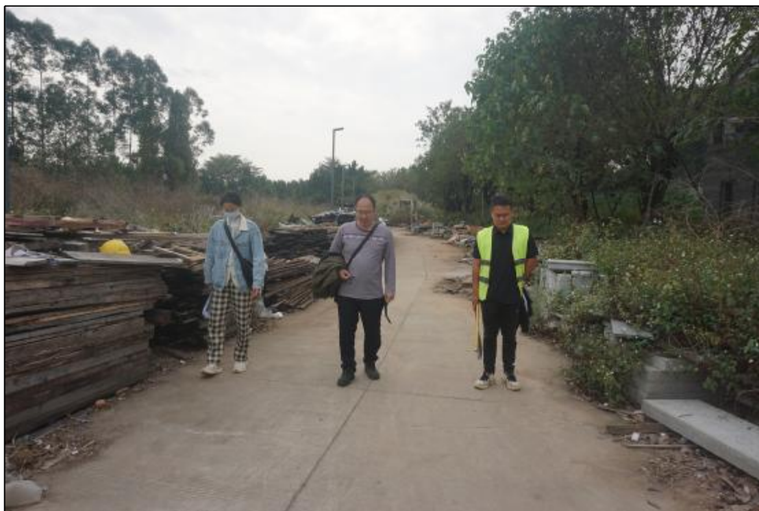
图 12 工作人员现场踏查（北-南）