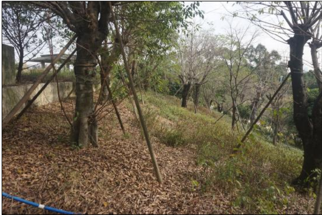
图 14 AH070738地块东部地貌照（南-北）