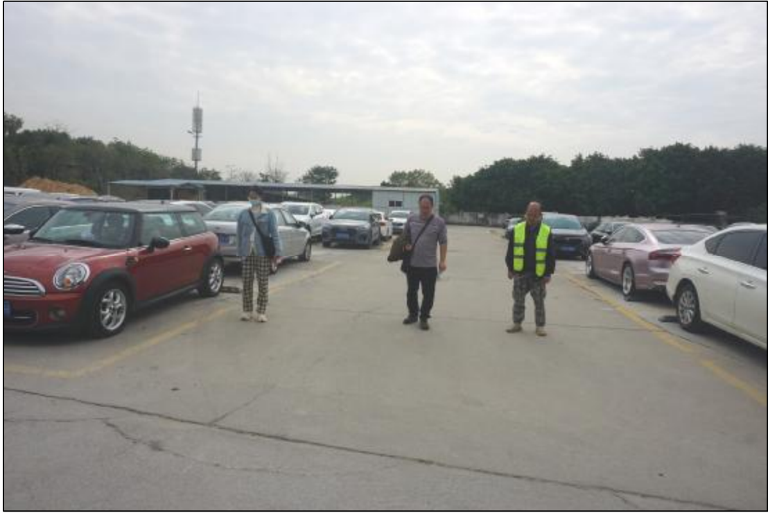
图 10 工作人员现场踏查（西-东）