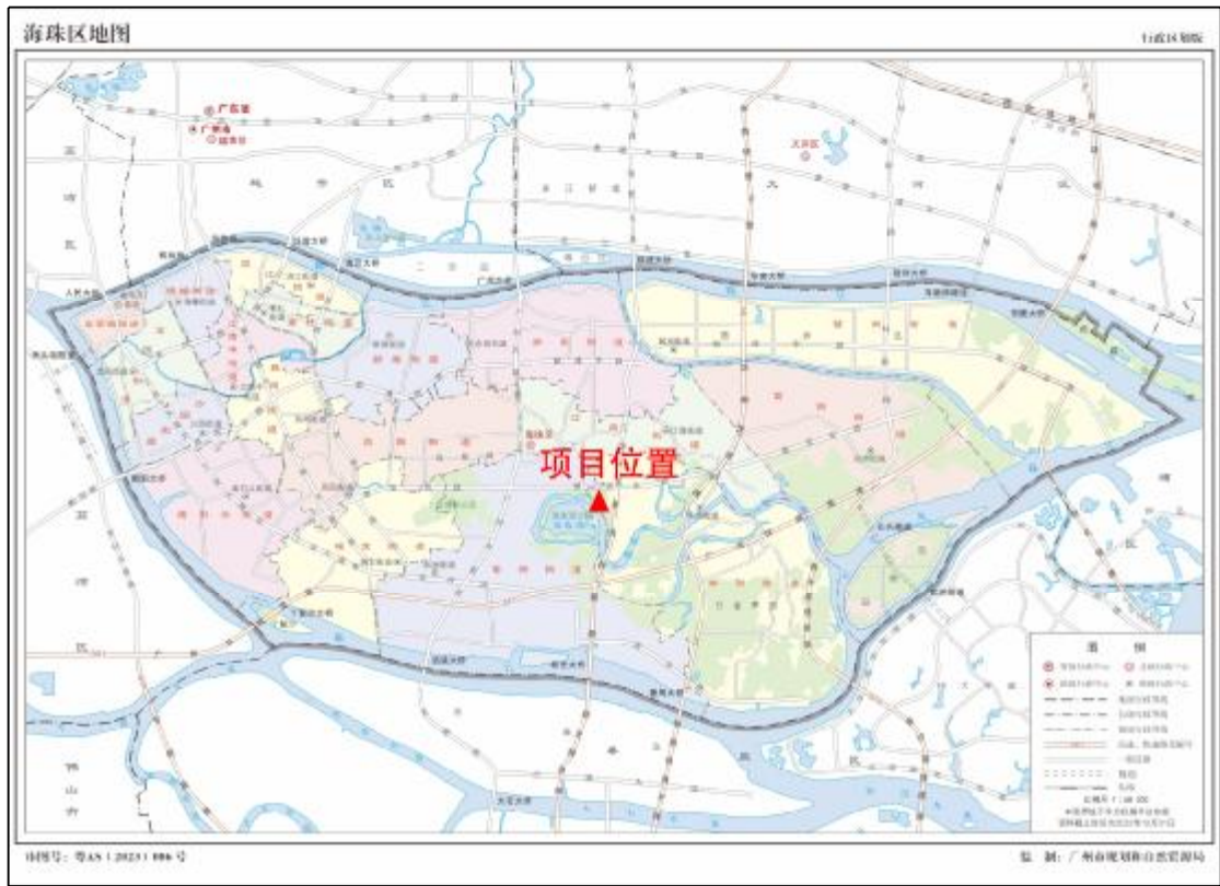
图 2 该项目在海珠区位置示意图（广东省自然资源厅）