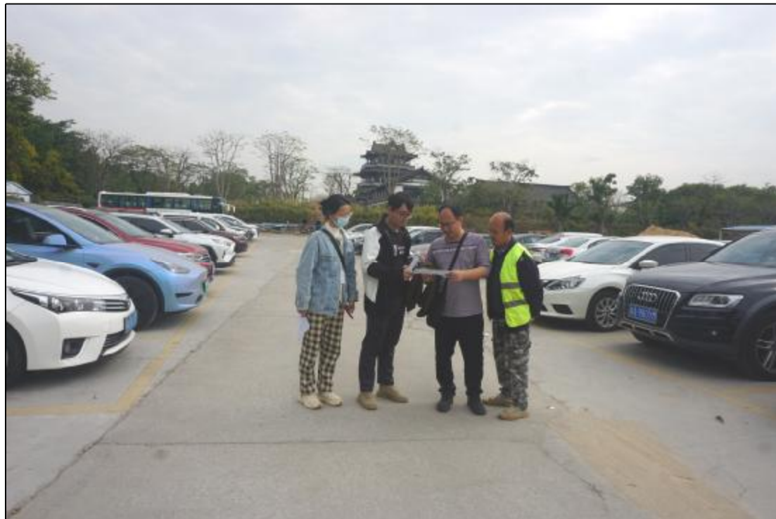
图 9 工作人员核对地块范围（西-东）