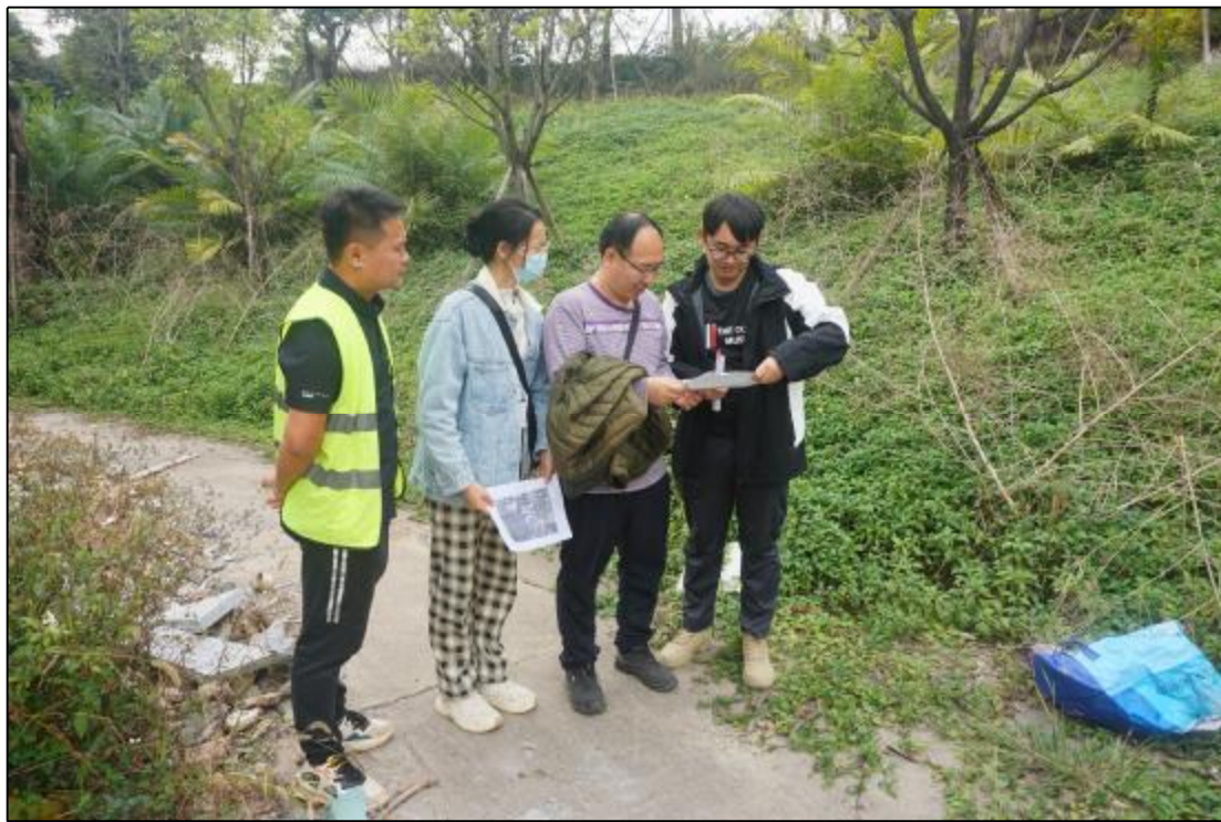
图 8 工作人员核对地块范围（东北-西南）