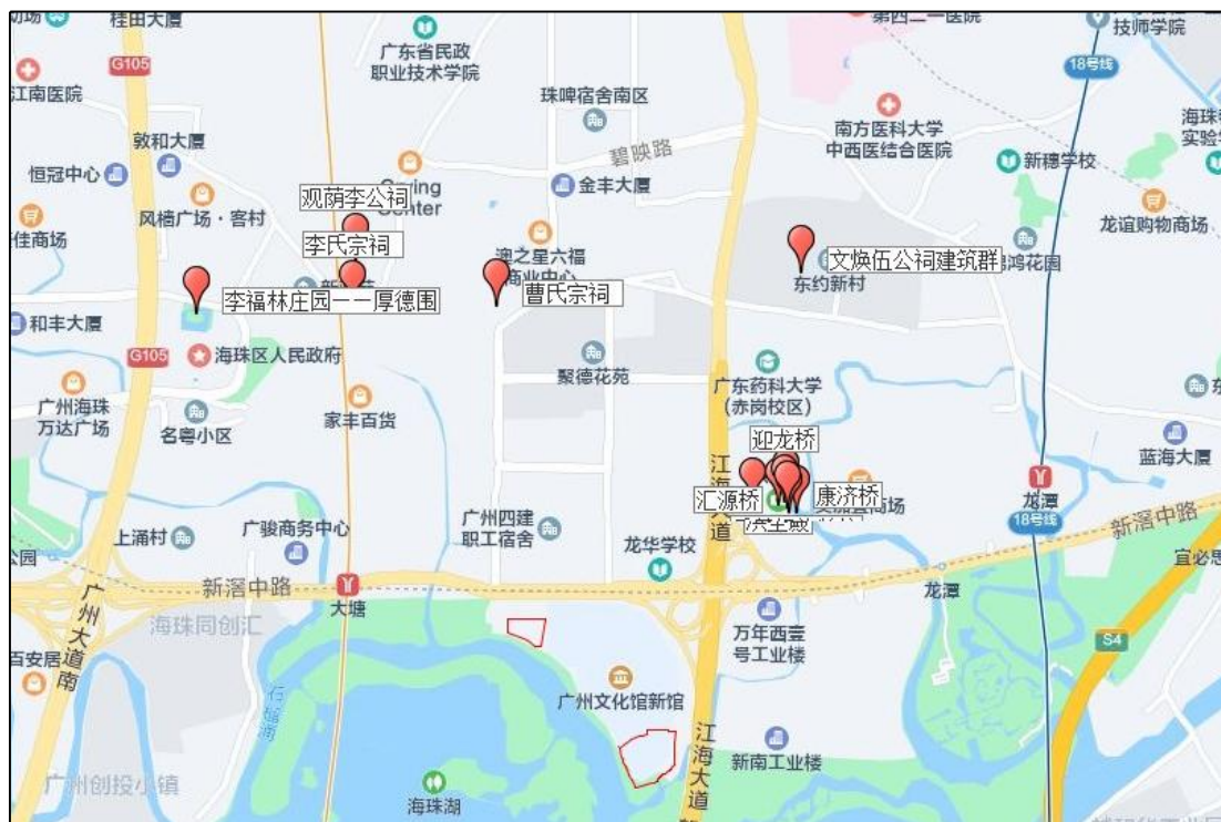
图 6 该项目地块周边地上文物资源分布示意图

根据《广州市文物普查汇编·海珠区卷》记载，距离地块最近的文物资源有李福林庄园——厚德围、观荫李公祠、李氏宗祠、曹氏宗祠、文焕伍公祠建筑群、“乐善好施”牌坊、纶生白公祠、龙潭村古建筑群等。