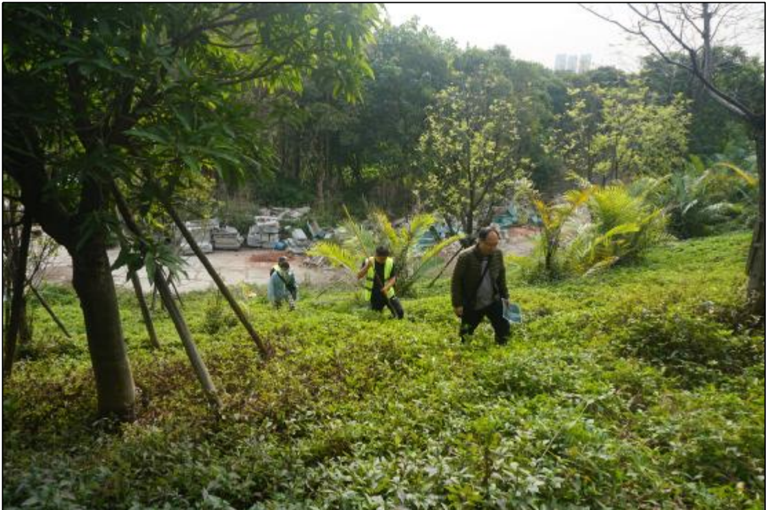
图 11 工作人员现场踏查（北-南）