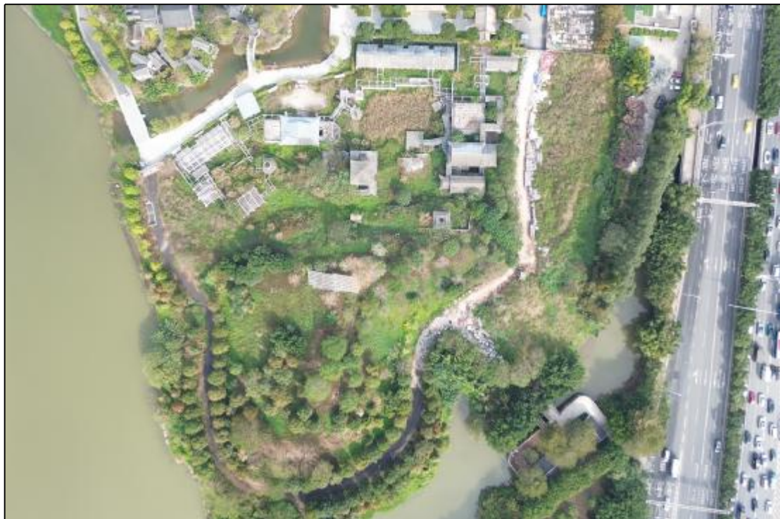
图 13 AH070738地块航拍照（上为北）