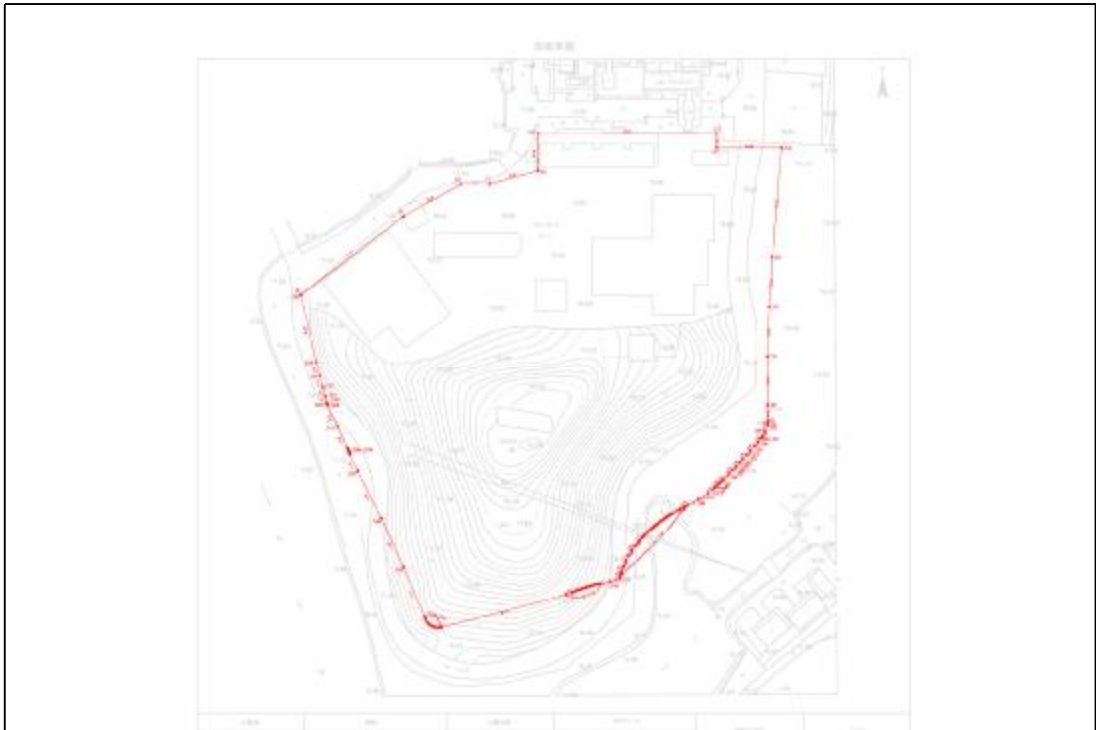
图 5 AH070738地块红线示意平面图（甲方提供）