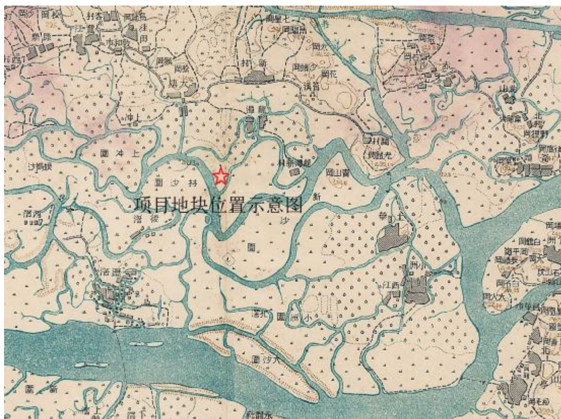
图 7 广东陆地测量局1930制版图（广州市近傍第五号局部）