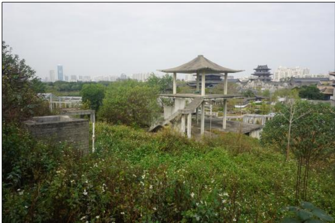
图 15 AH070738地块中部地貌照（东-西）