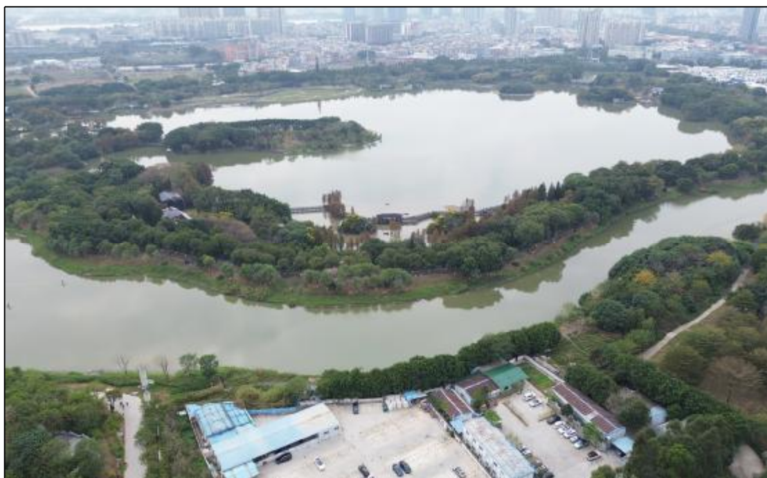
图 21 地块周边航拍照（东北-西南）