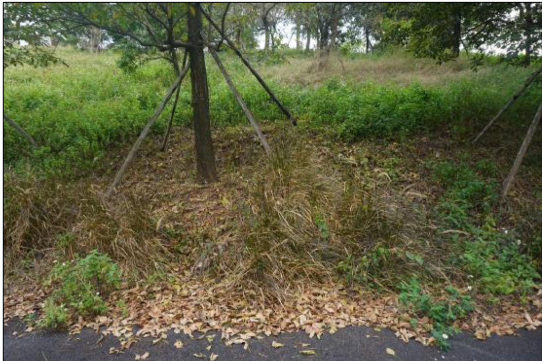
图 16 AH070738地块南部地貌照（南-北）