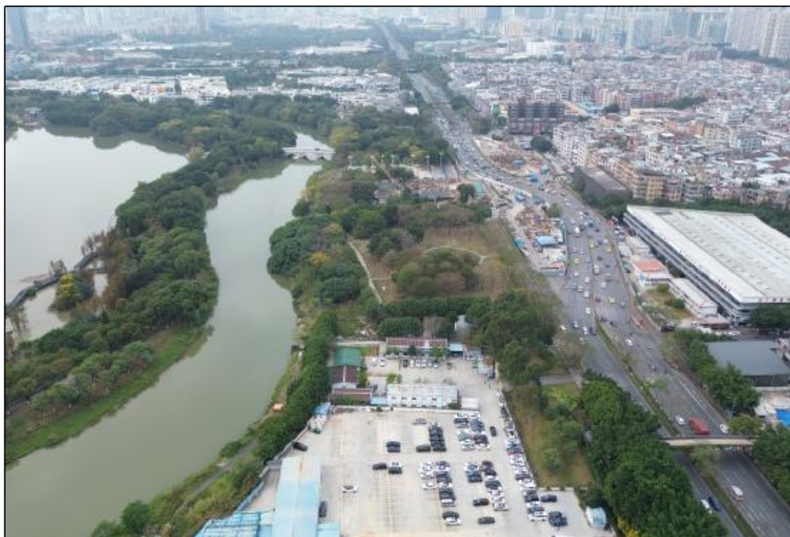
图 20 AH070737地块周边航拍照（东-西）