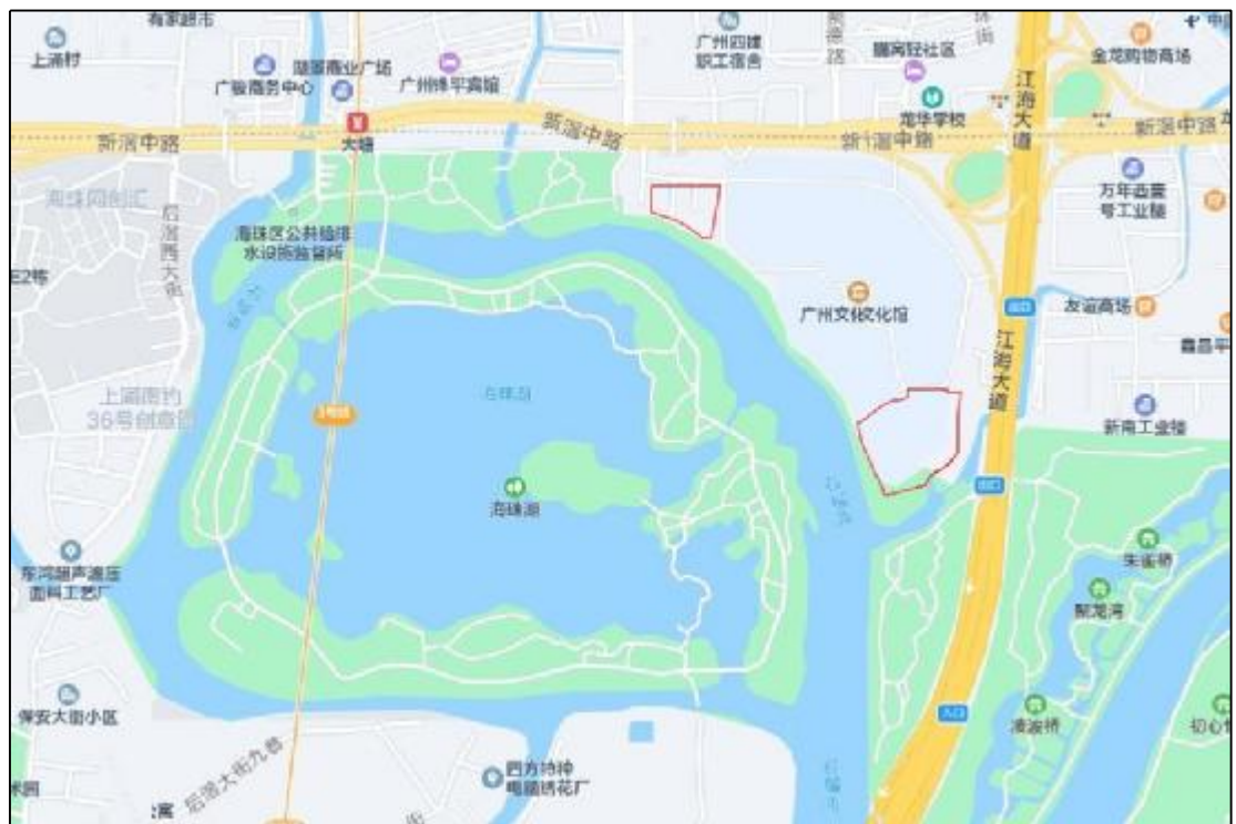
图 3 该项目地块周边位置图（腾讯地图）