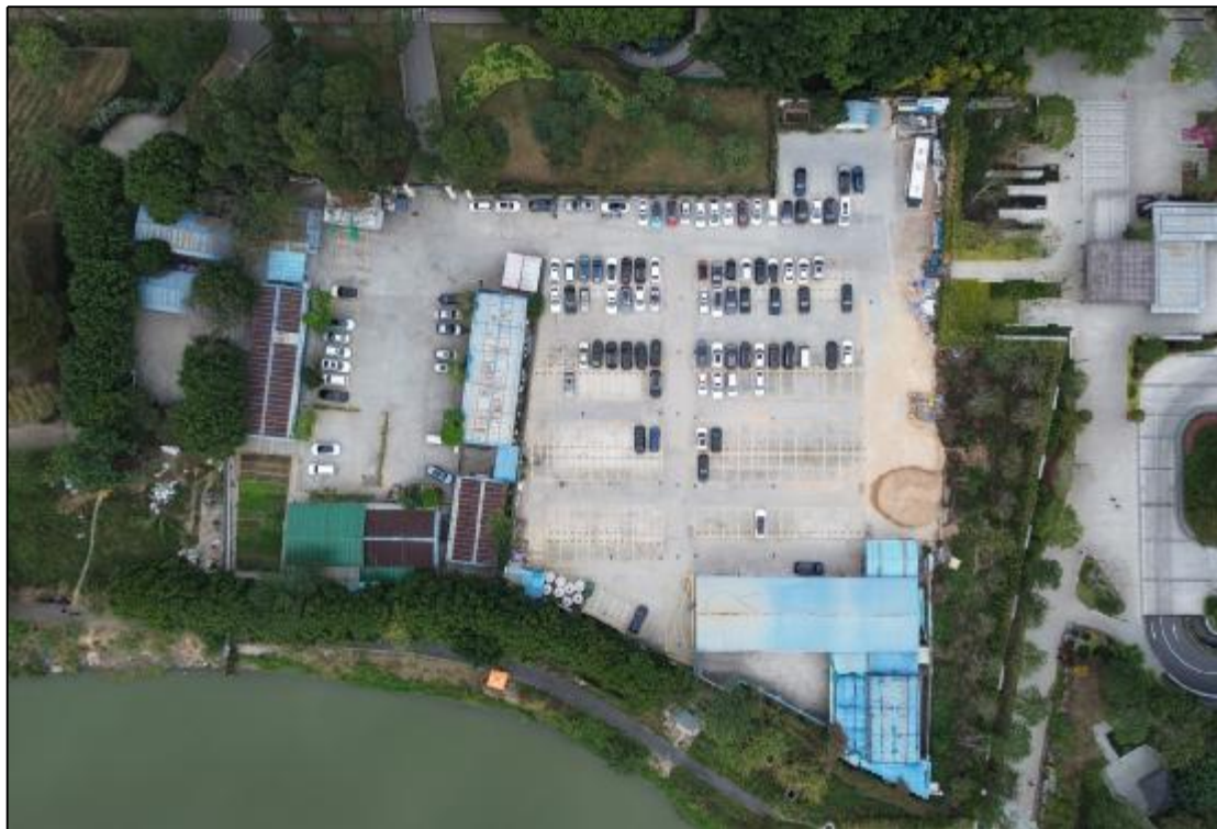
图 19 AH070737地块航拍照（上为北）