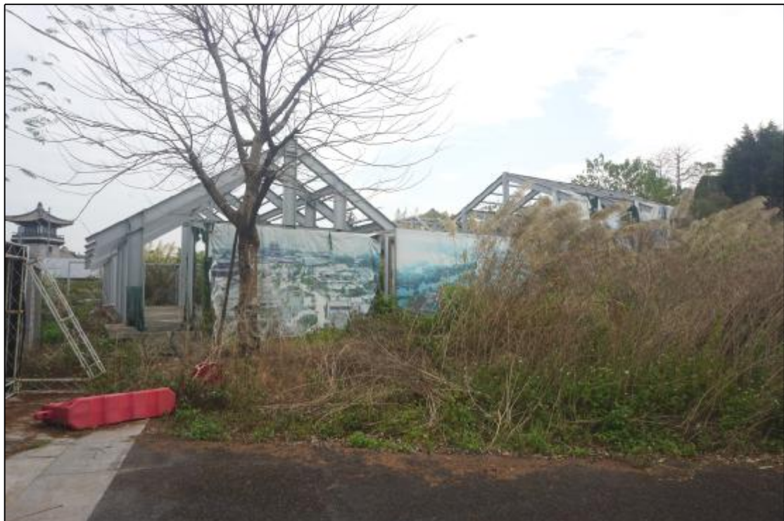
图 17 AH070738地块西部地貌照（西-东）