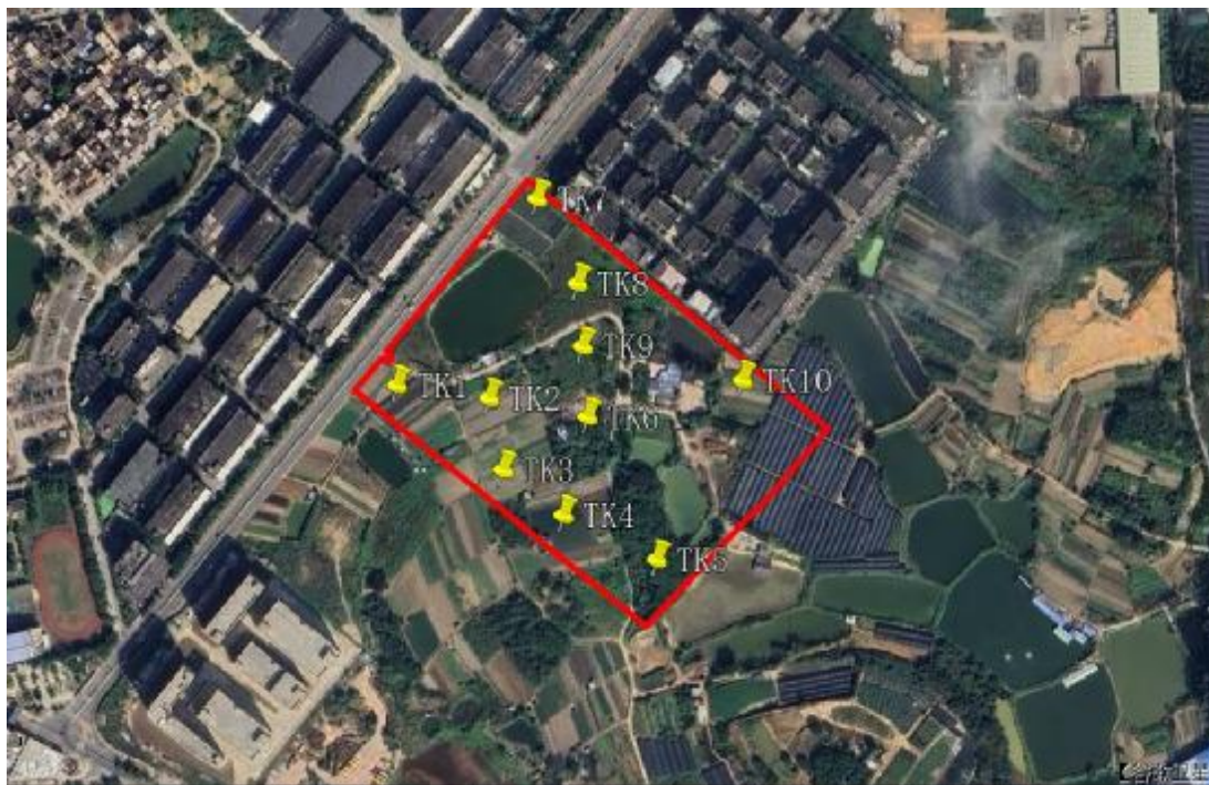
图 25 试探标准孔分布图（黄色标记点）

根据地形地貌及考古调查的工作需要,为了进一步了解并掌握该地块内地层堆积情况,我们在地块范围内进行试探,共选取 10 个标准型探孔,编号为 TK1-TK10。其具体情况简要如下: