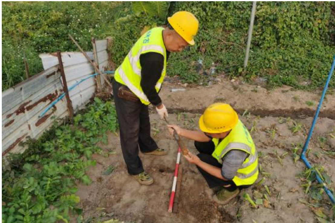
图 28 试探孔土样分析（西-东）