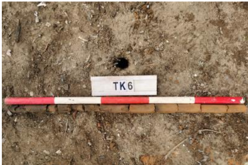
图 34 TK6 土样（一米标杆，土样由左往右）

①层：表土层，距地表深 0-0.6 米，厚 0.6 米，为灰褐色黏土，土质疏松，含植物根系、砂砾；以下为红褐色黏土，土质致密、纯净，系生土。