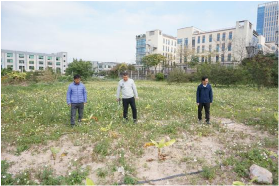
图 7 现场踏查（西南-东北）