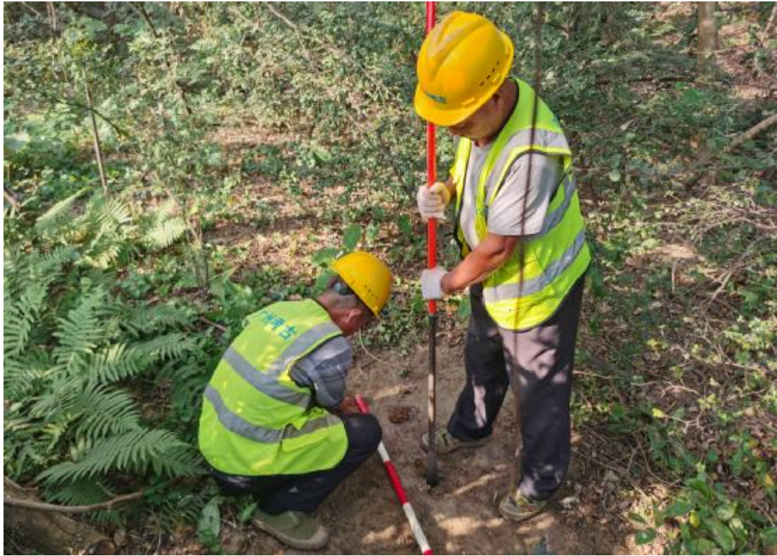
图 27 试探孔提取土样（西南-东北）