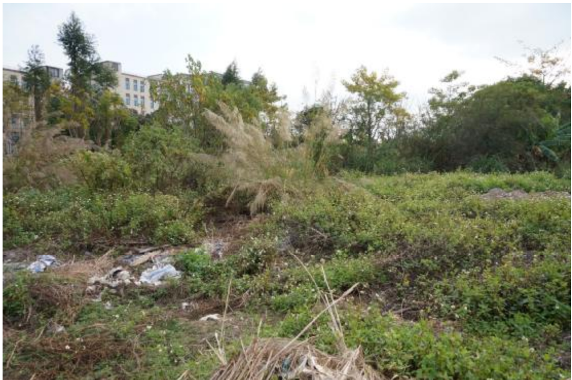
图 18 地块内中部现状（西北-东南）