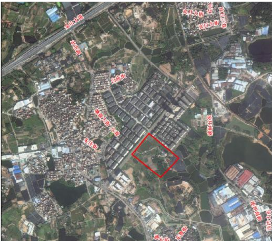
图 5 项目地块卫星红线图（收储单位提供）