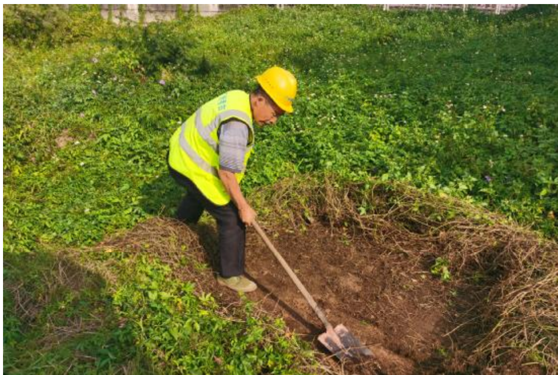
图 26 试探孔土样表面清理（西-东）