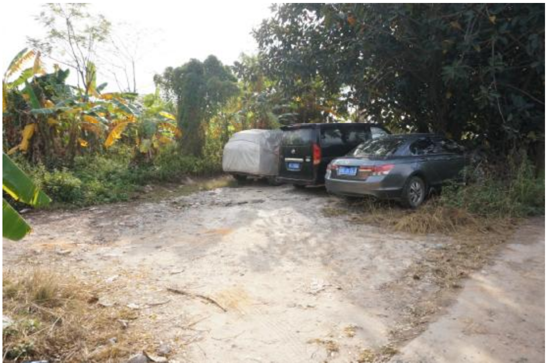
图 20 地块内中部现状（西-东）