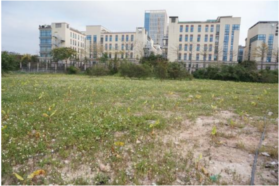
图 11 地块内北部现状（西-东）