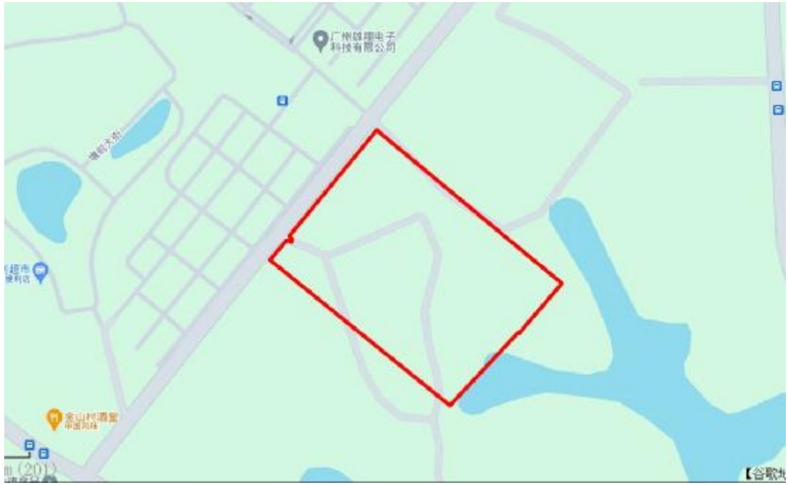
图 4 项目地块周边环境示意图（奥维地图）