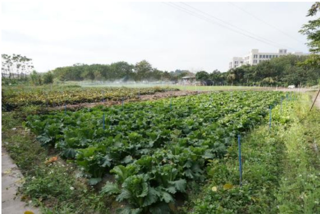
图 23 地块内南部现状（东北-西南）