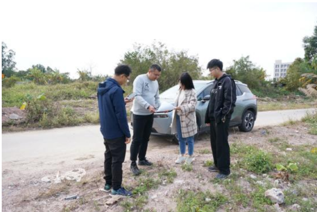
图 6 工作人员确认地块范围（东北-西南）