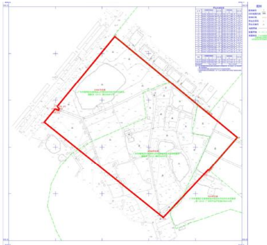
图 3 项目地块地形红线图