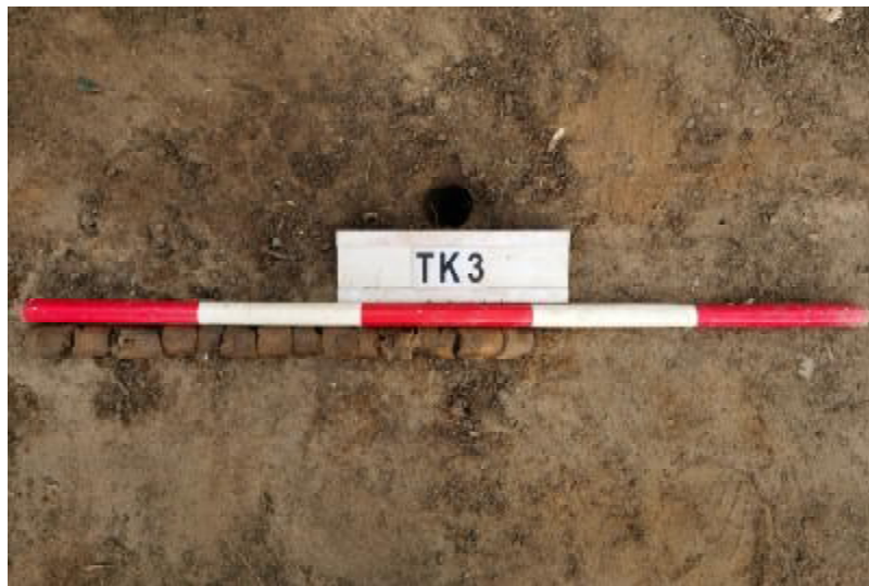
图 31 TK3 土样（一米标杆，土样由左往右）

①层：垫土层，距地表深 0-0.6 米，厚 0.6 米，为灰红色黏土，土质疏松，含植物根系、砂砾；以下为大石块，无法继续提取土样。