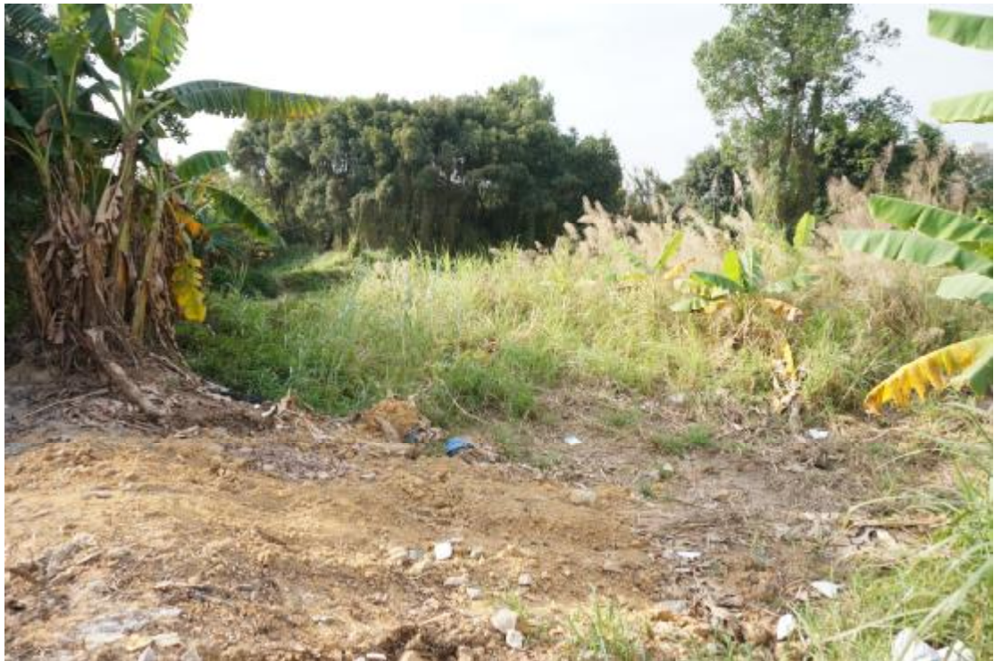
图 12 地块内东部现状（北-南）