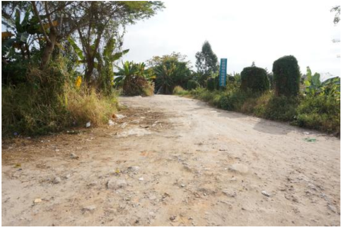
图 21 地块内中部现状 (西南-东北)