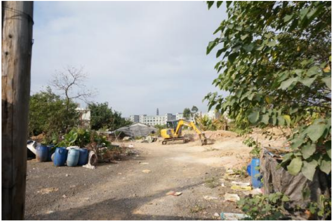
图 19 地块内中部现状（东-西）