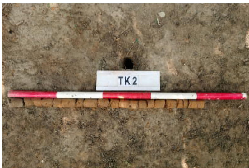
图 30 TK2 土样 (一米标杆, 土样由左往右)

①层: 表土层, 距地表深 0-0.10 米, 厚 0.10 米, 为灰褐色黏土, 土质疏松, 含植物根系、砂砾; 以下为红褐色黏土, 土质致密、纯净, 系生土