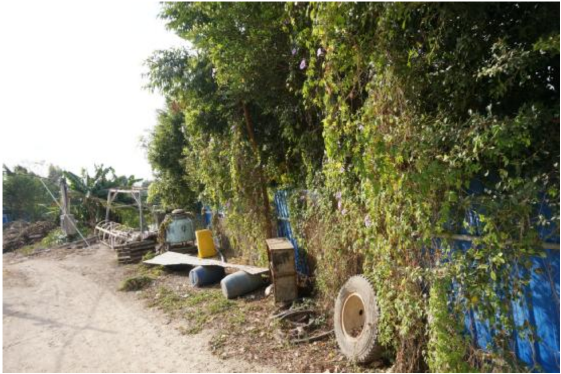
图 15 地块内东部现状（东-西）