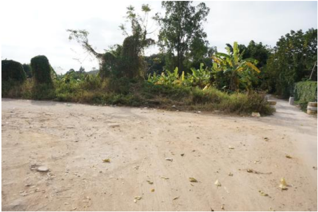
图 17 地块内中部现状（西-东）