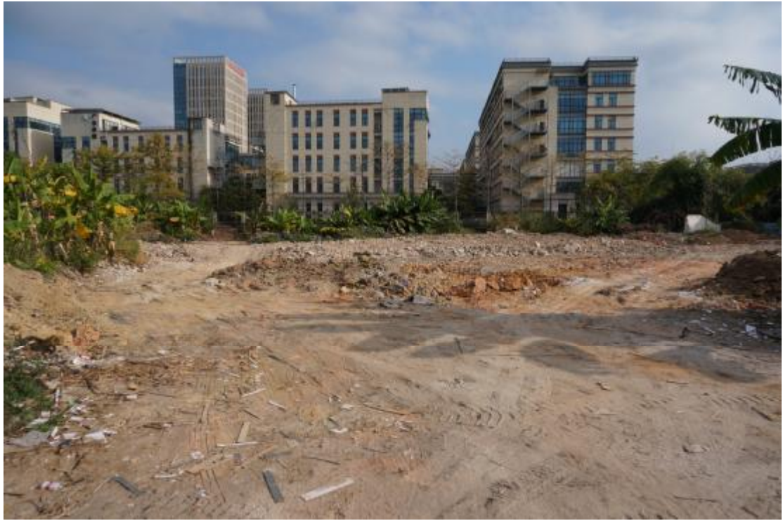
图 13 地块内东部现状（南-北）