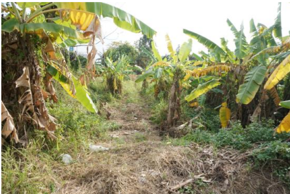
图 24 地块内西部现状（西-东）