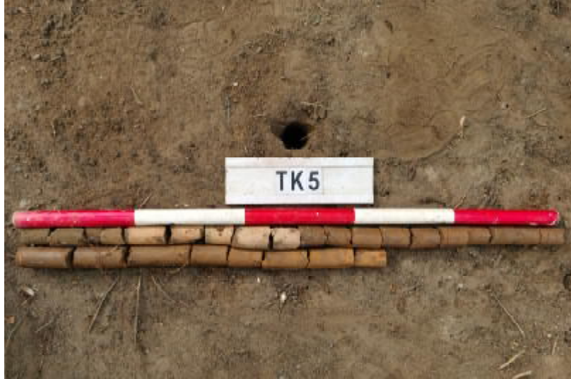
图 33 TK5 土样（一米标杆，土样由左上往右下）

①层：垫土层，距地表深 0-1.4 米，厚 1.4 米，为灰红色黏土，土质疏松，含植物根系、黄沙；以下为红褐色黏土，土质致密、纯净，系生土。