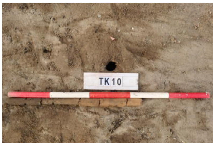
图 38 TK10 土样 (一米标杆, 土样由左往右)

①层: 垫土层, 距地表深 0-0.4 米, 厚 0.4 米, 为灰褐色黏土, 土质疏松, 含植物根系、砂砾; 以下为红褐色黏土, 土质致密、纯净, 系生土。