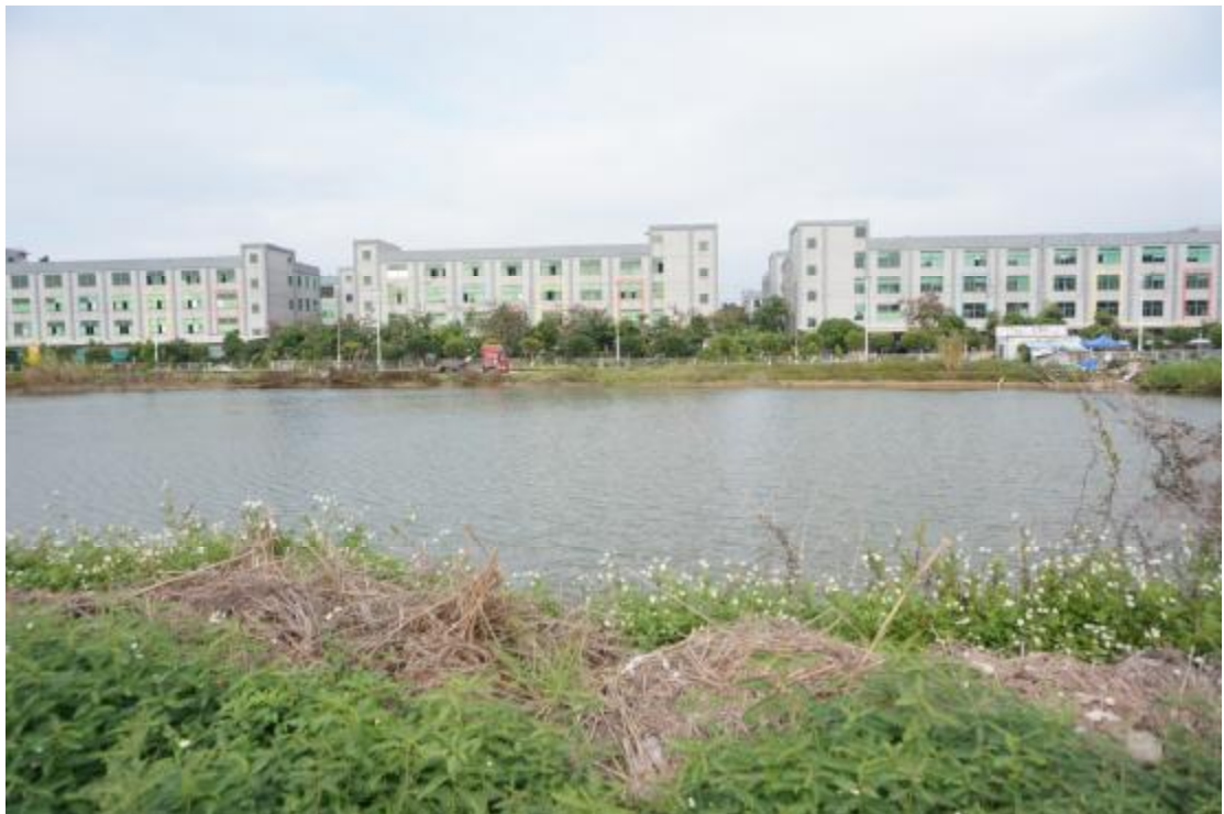
图 10 地块内北部现状（南-北）