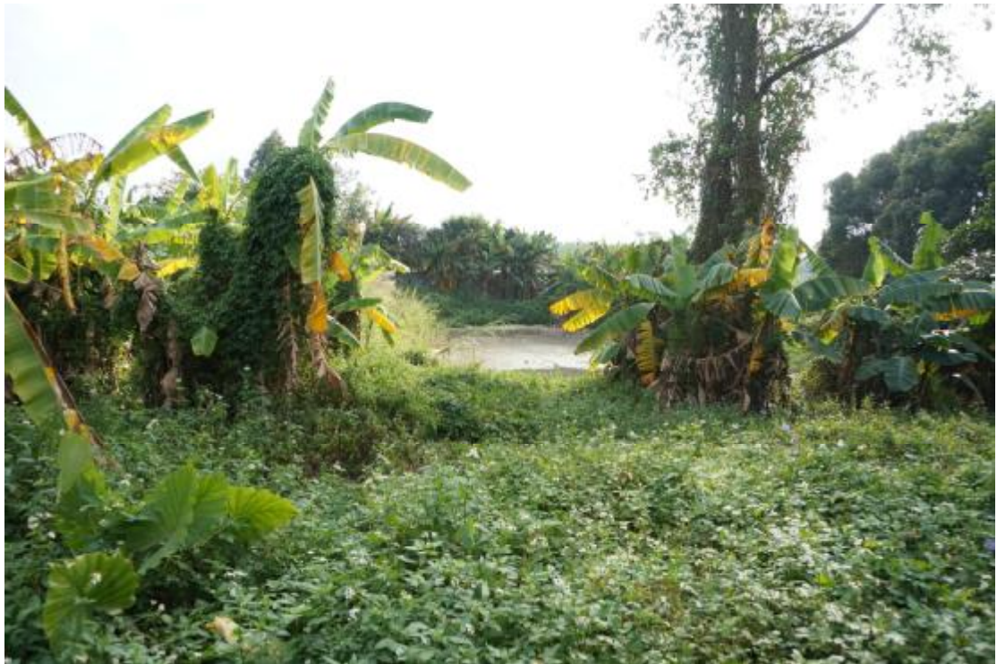
图 14 地块内东部现状（西-东）