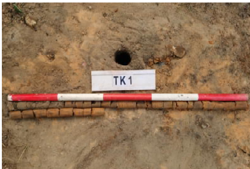
图 29 TK1 土样 (一米标杆, 土样由左上往右下)

①层: 垫土层, 距地表深 0-1.1 米, 厚 1.1 米, 为灰红色黏土, 土质疏松, 含植物根系、砂砾; 以下为红褐色黏土, 土质致密、纯净, 系生土。