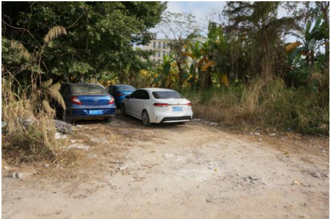
图 16 地块内中部现状（南-北）