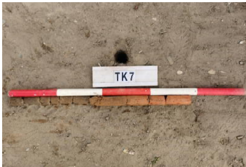
图 35 TK7 土样 (一米标杆, 土样由左往右)

①层: 表土层, 距地表深 0-0.5 米, 厚 0.5 米, 为灰褐色黏土, 土质疏松, 含植物根系、砂砾; 以下为红褐色黏土, 土质致密、纯净, 系生土。