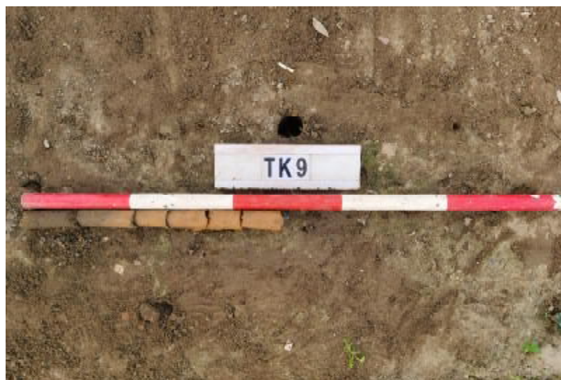
图 37 TK9 土样 (一米标杆, 土样由左往右)

①层: 垫土层, 距地表深 0-0.16 米, 厚 0.16 米, 为灰褐色黏土, 土质疏松, 含植物根系、砂砾; 以下为红褐色黏土, 土质致密、纯净, 系生土。