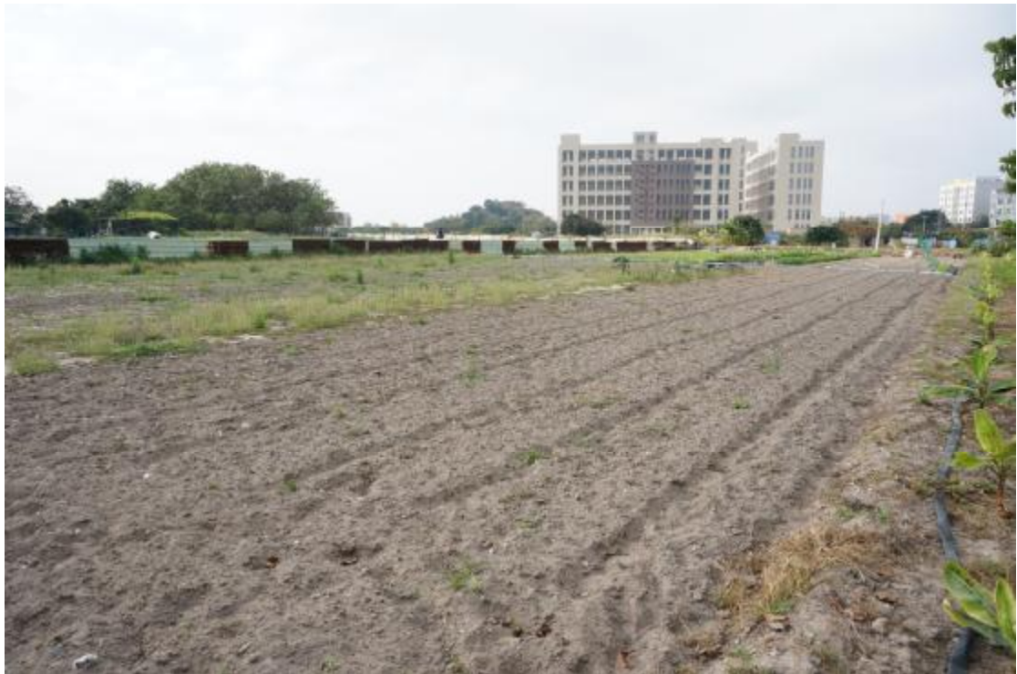
图 22 地块内南部现状 (东北-西南)