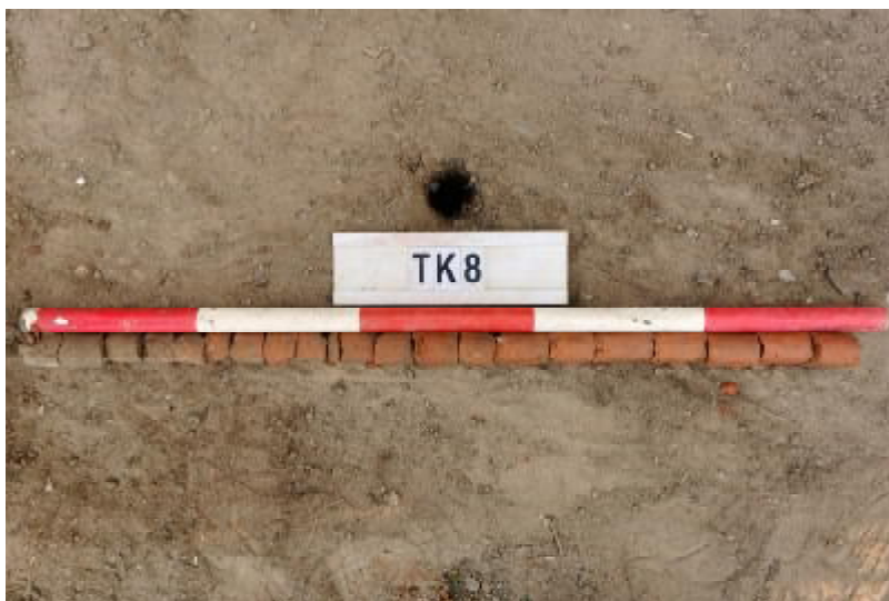
图 36 TK8 土样 (一米标杆, 土样由左上往右下)

①层: 表土层, 距地表深 0-0.6 米, 厚 0.6 米, 为灰褐色黏土, 土质疏松, 含植物根系、砂砾; 以下为红褐色黏土, 土质致密、纯净, 系生土。