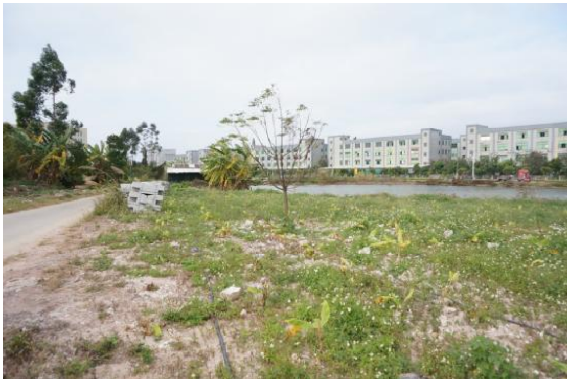
图 8 地块内北部现状（东北-西南）