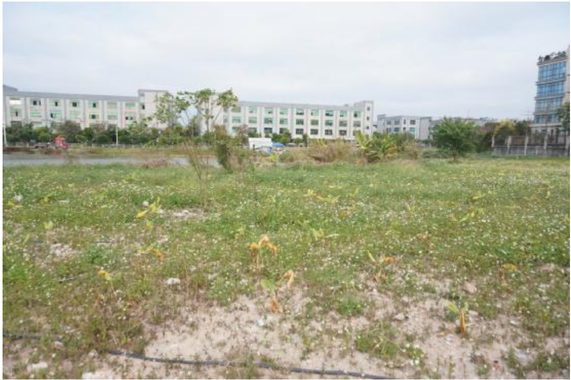
图 9 地块内北部现状（南-北）