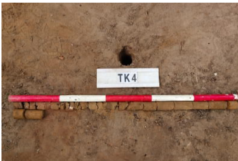
图 32 TK4 土样（一米标杆，土样由左上往右下）

①层：表土层，距地表深 0-0.6 米，厚 0.6 米，为灰红色黏土，土质疏松，含植物根系、砂砾；以下为红褐色黏土，土质致密、纯净，系生土。