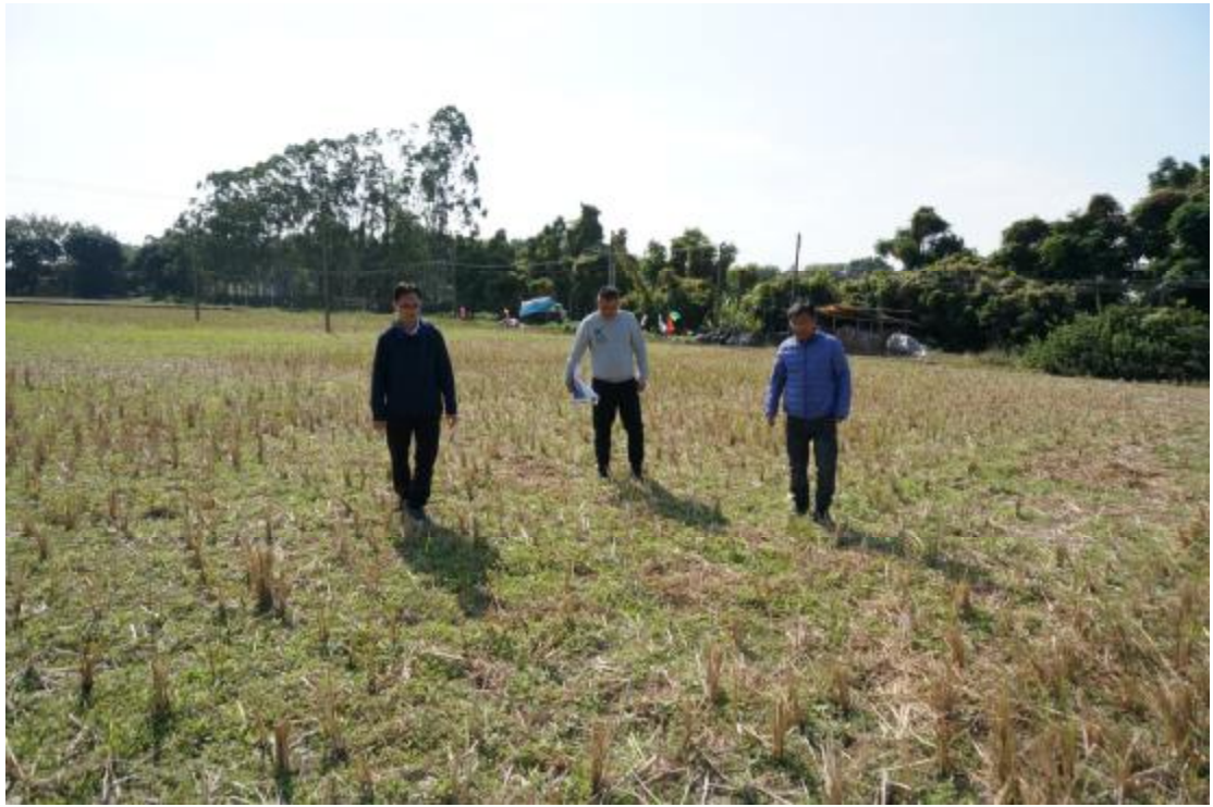
图 7 现场踏查（东北-西南）