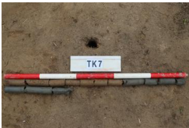
图 39 TK7 土样 (一米标杆, 土样由左上往右下)

②层: 淤积层, 距地表深 0.65-1.38 米, 厚 0.73 米, 为灰黑色淤泥, 土质较疏松, 无明显包含物。以下渗水严重, 无法提取土样。