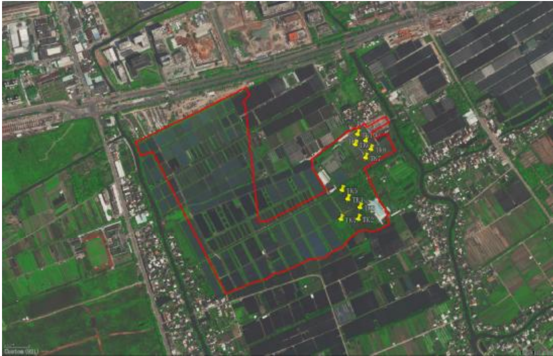
图 29 试探标准孔分布图(黄色标记点)

根据地形地貌及考古调查的工作需要,为了进一步了解并掌握该地块内地层堆积情况,我们在地块东部(其余区域多为水塘、道路,无法试探)进行试探,共选取 10 个标准型探孔,编号为 TK1-TK10。其具体情况简要如下: