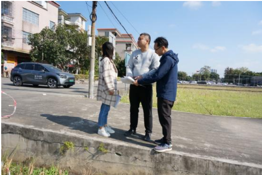
图 6 工作人员确认地块范围（西-东）