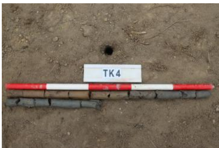
图 36 TK4 土样 (一米标杆, 土样由左上往右下)

②层: 淤积层, 距地表深 0.6-1.45 米, 厚 0.85 米, 为灰黑色淤泥, 土质较疏松, 无明显包含物。以下渗水严重, 无法提取土样。