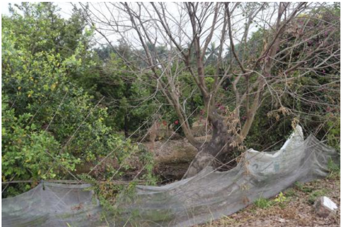
图 18 地块内东部现状（东北-西南）