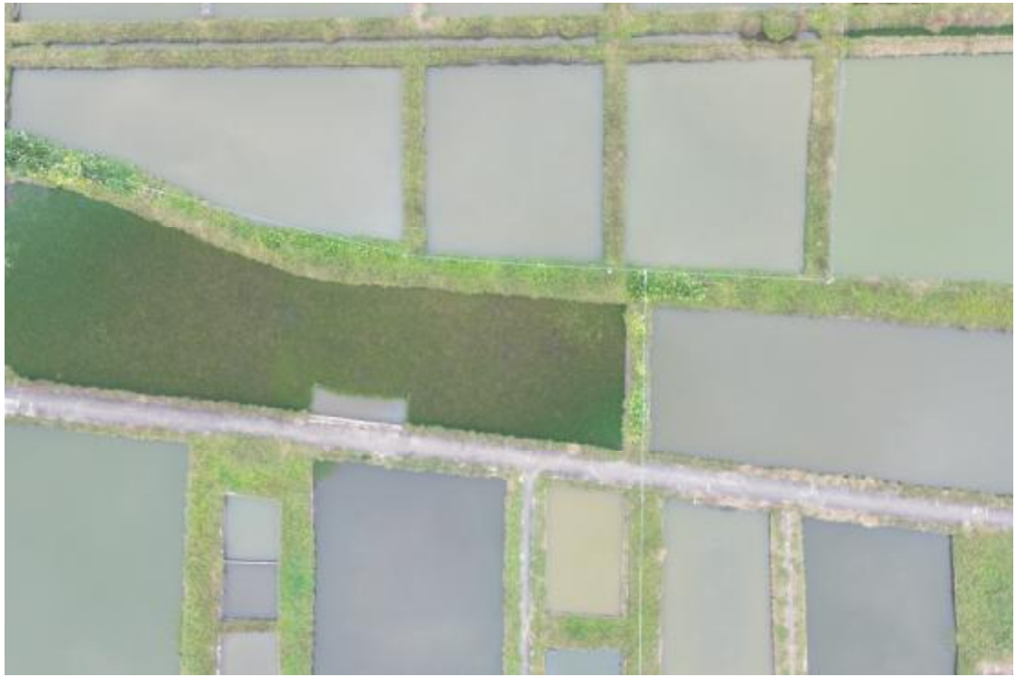
图 11 地块内中部现状（上北-下南）