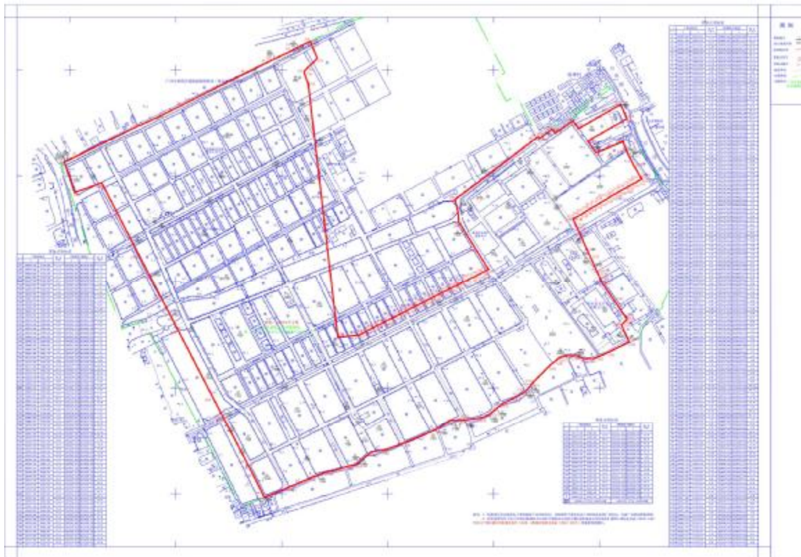
图 3 项目地块地形图（收储单位提供）