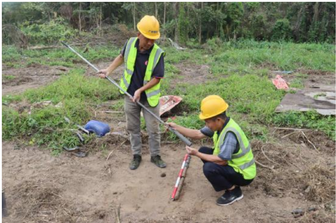
图 32 试探孔土样分析（西-东）