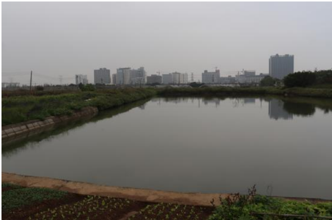
图 28 地块内南部现状（南-北）