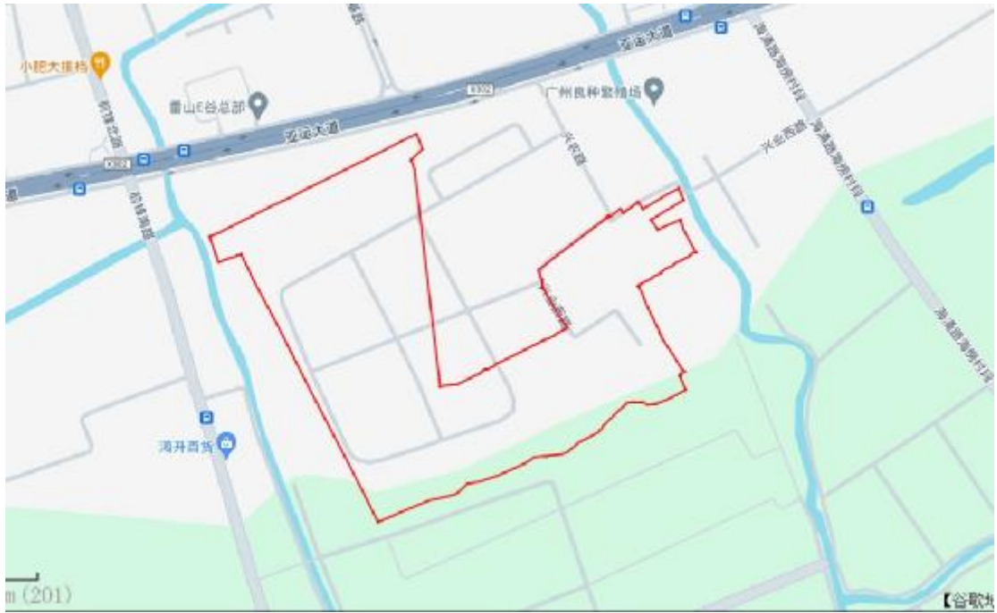
图 4 项目地块周边环境示意图（奥维地图）