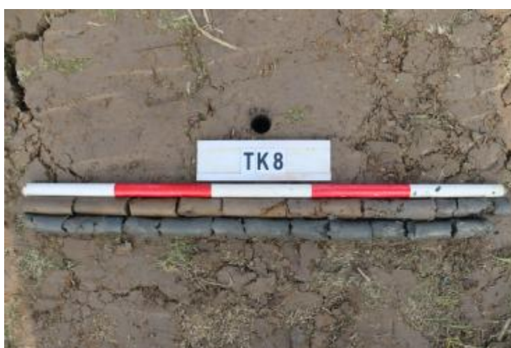
图 40 TK8 土样 (一米标杆, 土样由左上往右下)

②层: 淤积层, 距地表深 1.0-2.0 米, 厚 1.0 米, 为灰黑色淤泥, 土质较疏松, 无明显包含物。以下渗水严重, 无法提取土样。