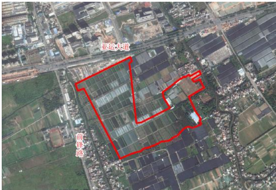
图 5 项目地块卫星影像图（收储单位提供）