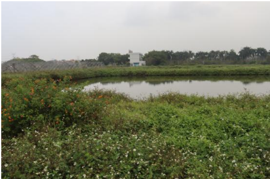
图 14 地块内中部现状（西-东）