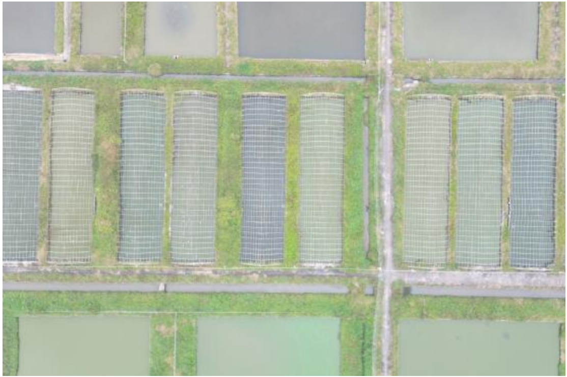
图 23 地块内南部现状（上北-下南）