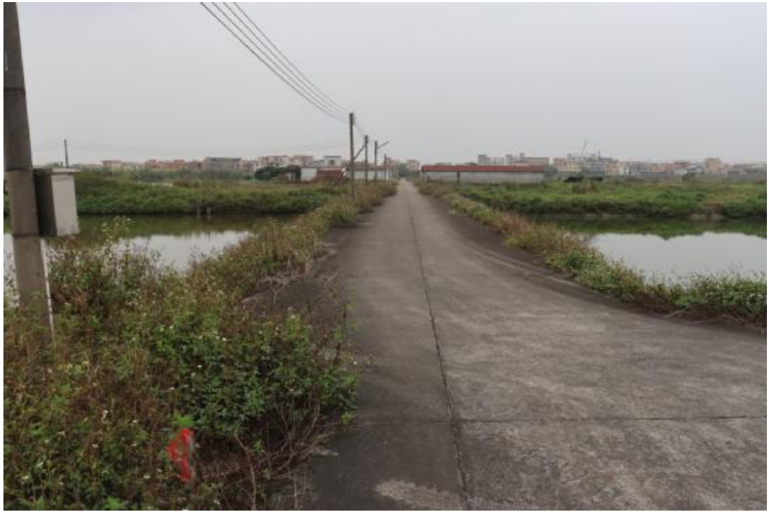
图 13 地块内中部现状（东-西）