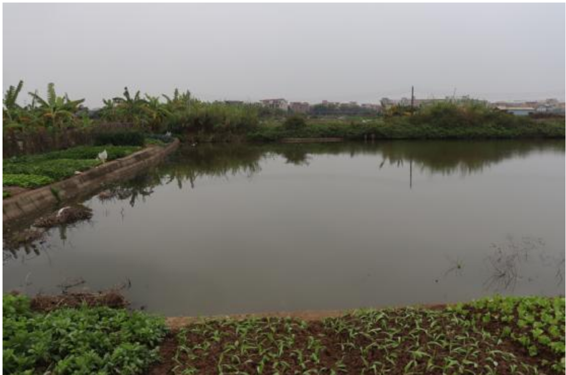
图 26 地块内南部现状（东-西）