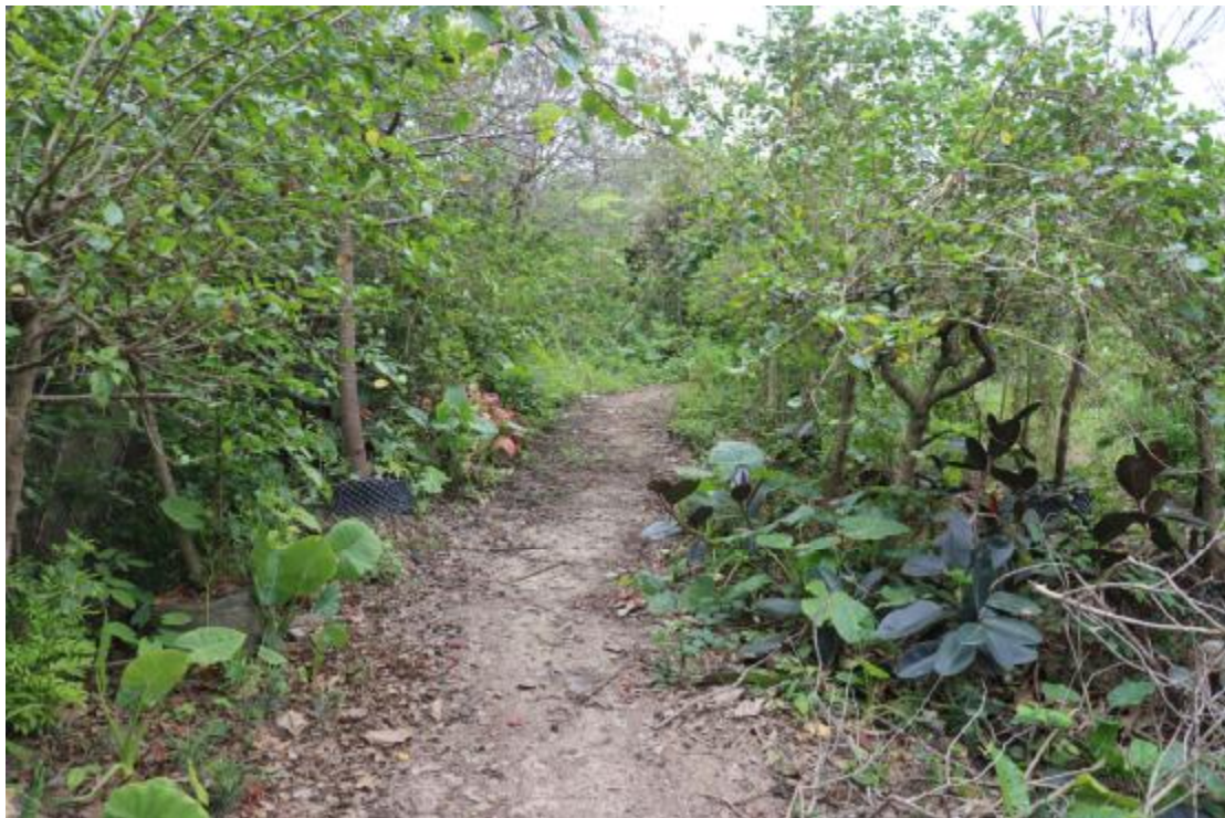
图 16 地块内东部现状（北-南）