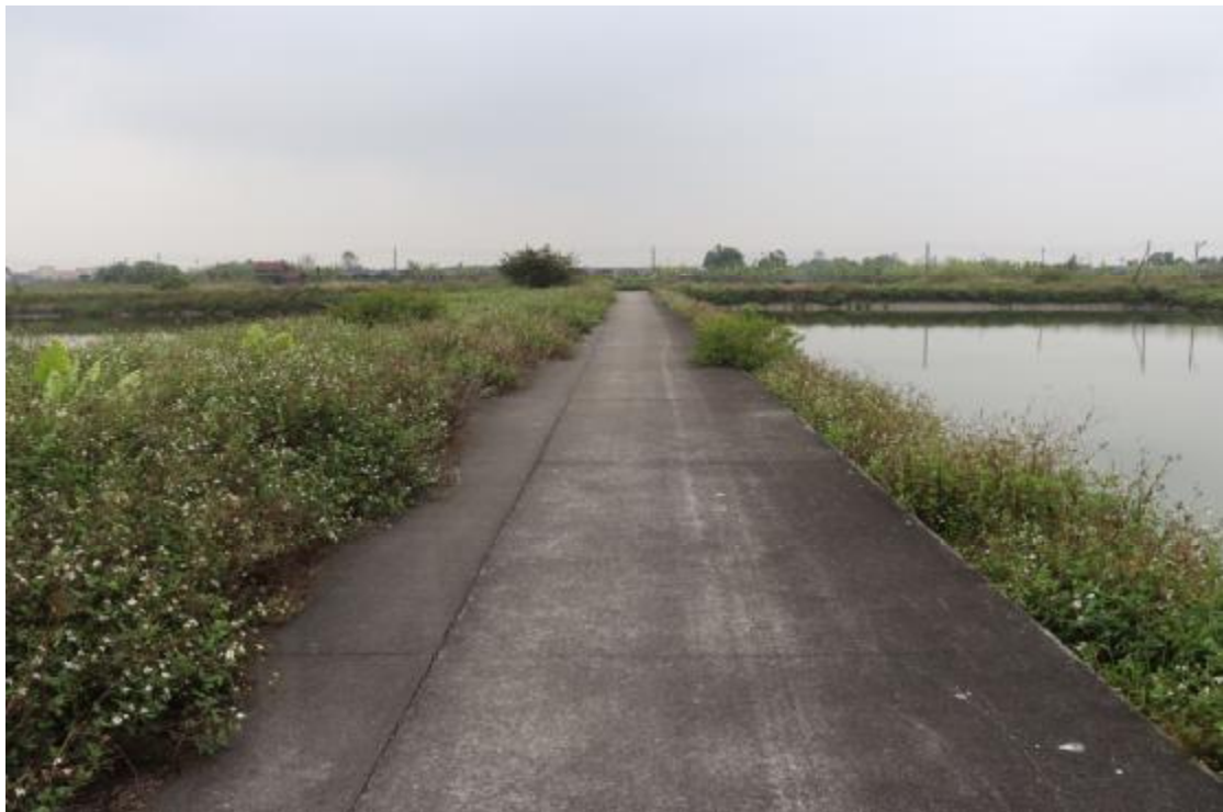
图 12 地块内中部现状（北-南）