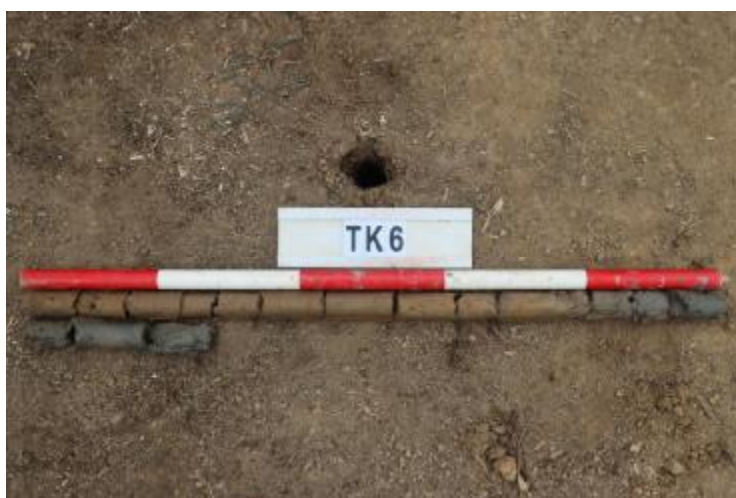
图 38 TK6 土样 (一米标杆, 土样由左上往右下)

②层: 淤积层, 距地表深 0.8-1.3 米, 厚 0.5 米, 为灰黑色淤泥, 土质较疏松, 无明显包含物。以下渗水严重, 无法提取土样。