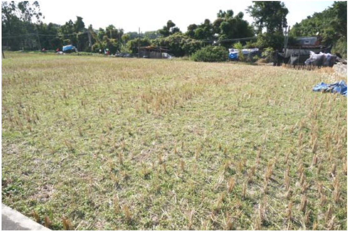
图 19 地块内东部现状（东北-西南）