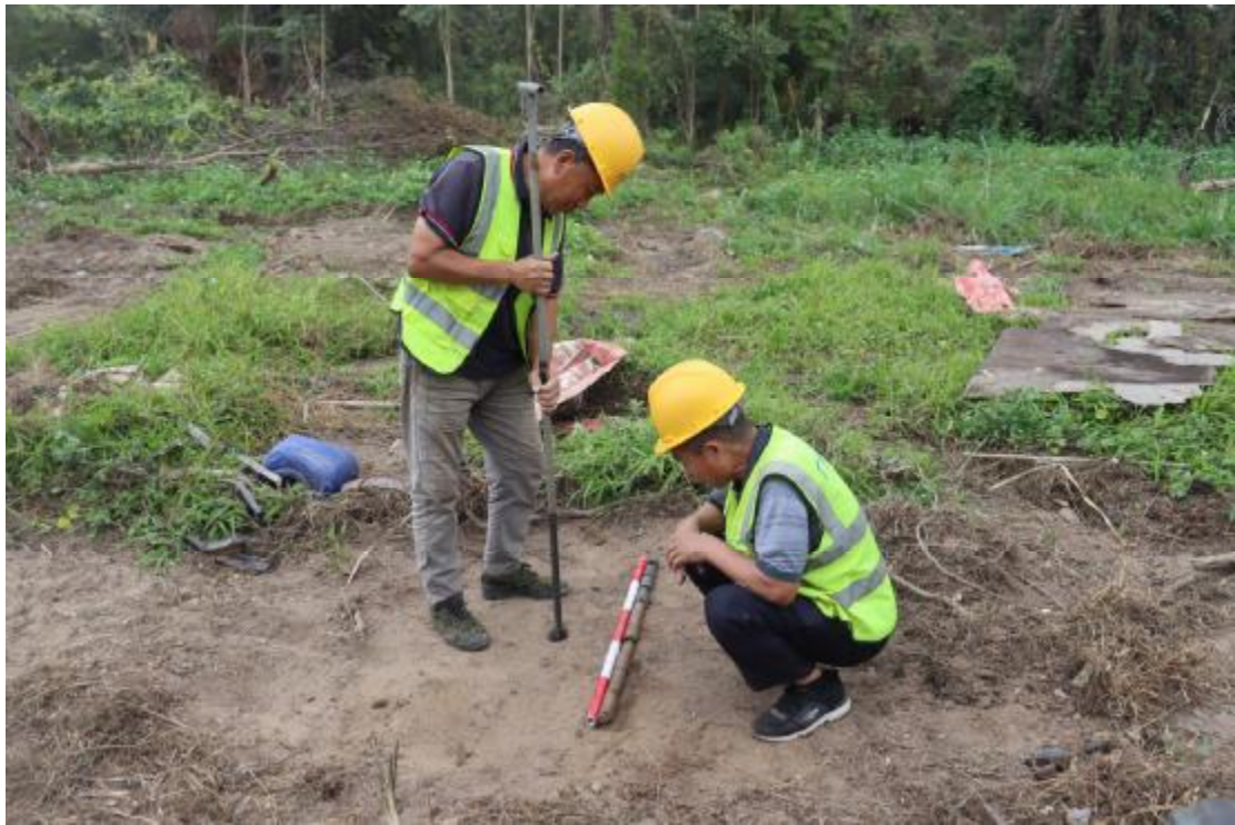
图 31 试探孔提取土样（西-东）