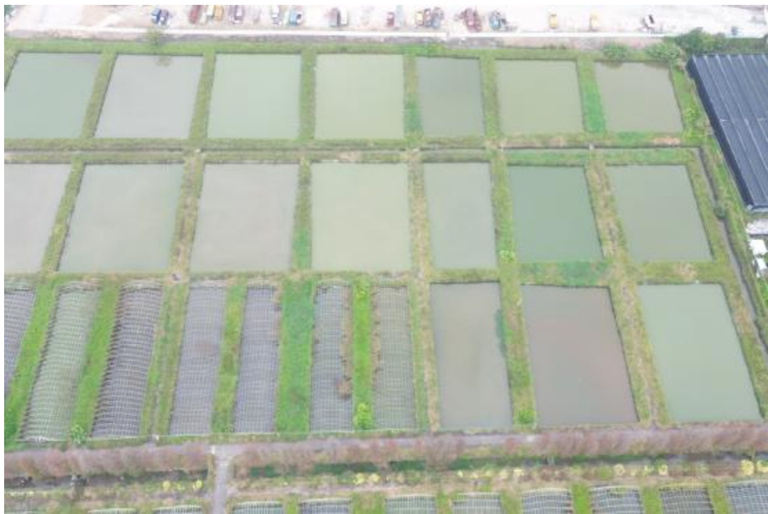
图 9 地块内北部现状 (南-北)