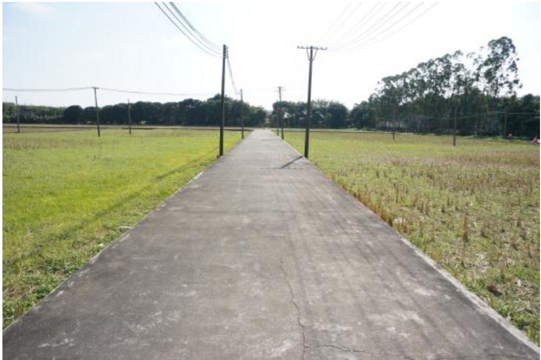
图 17 地块内东部现状（北-南）