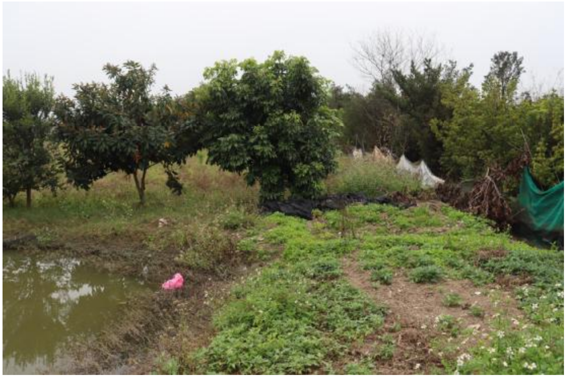
图 27 地块内南部现状（东-西）