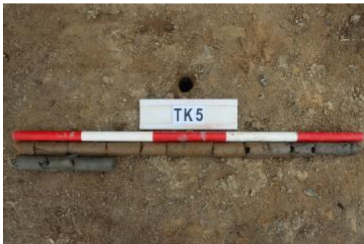
图 37 TK5 土样 (一米标杆, 土样由左上往右下)

②层: 淤积层, 距地表深 0.7-1.3 米, 厚 0.6 米, 为灰黑色淤泥, 土质较疏松, 无明显包含物。以下渗水严重, 无法提取土样。