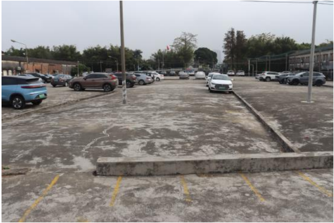
图 21 地块内东部现状（西-东）