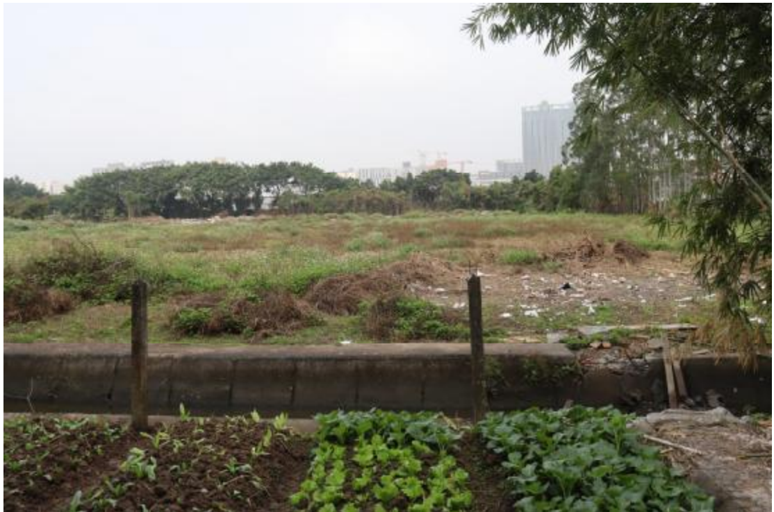
图 20 地块内东部现状（东南-西北）