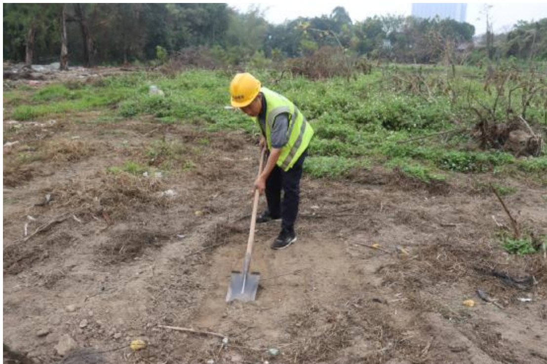
图 30 试探孔土样表面清理(南-北)