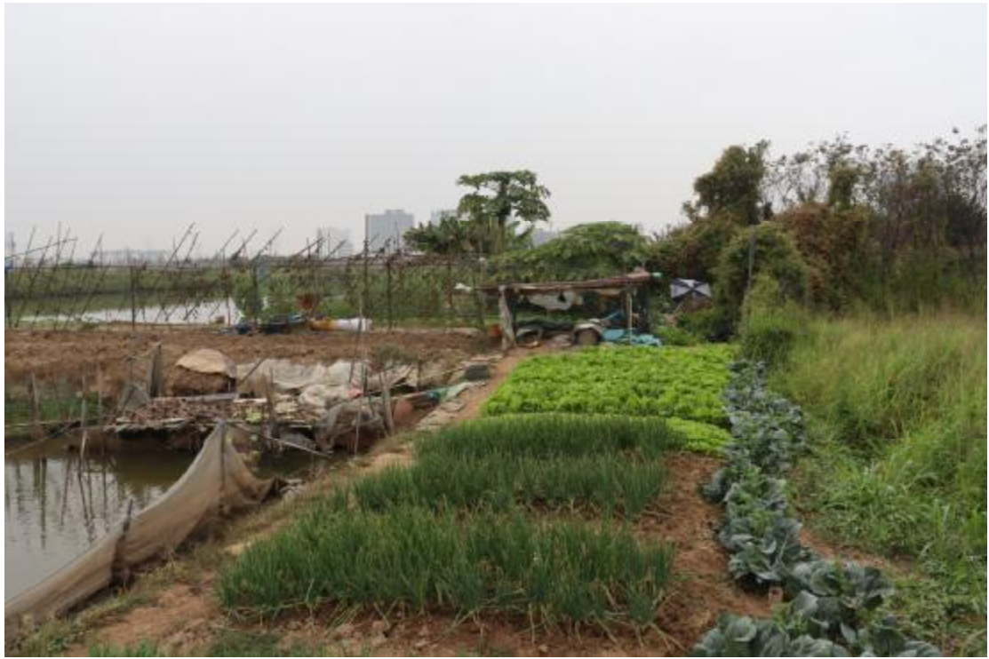
图 25 地块内南部现状（东南-西北）