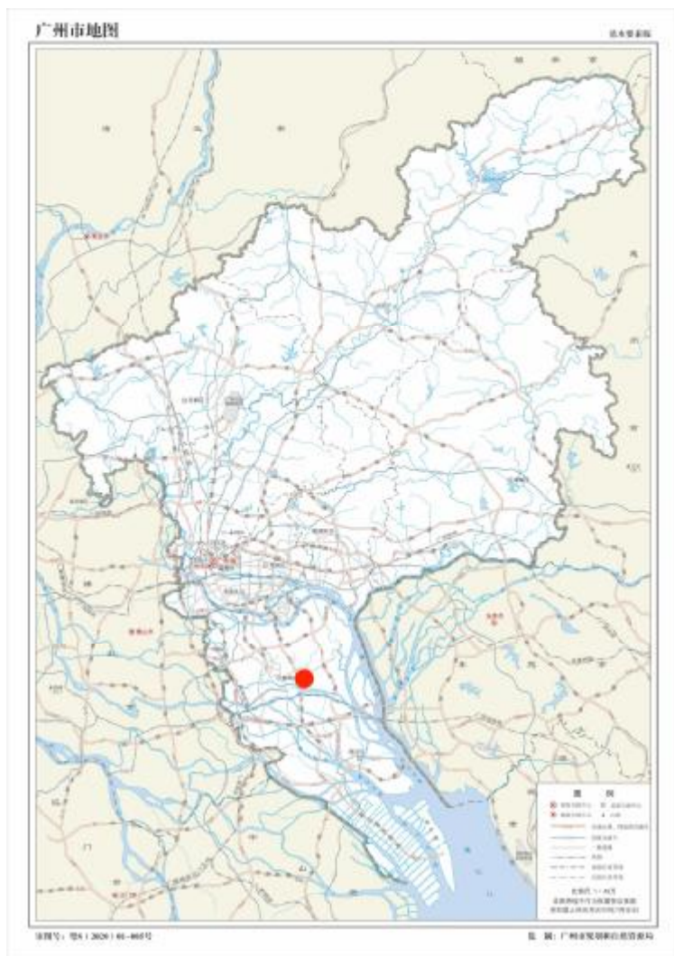
图 1 项目地块在广州市位置示意图（广州市规划和自然资源局）

根据《中华人民共和国文物保护法》《广州市文物保护规定》，按照《广州市文物局关于番禺区 2023 年度第十四批次使用土地考古调查勘探工作的复函》（文物 2023322 号）指导意见，受广州市番禺区土地开发中心委托，由我院负责该地块的考古调查工作。