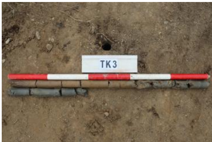
图 35 TK3 土样 (一米标杆, 土样由左上往右下)

②层: 淤积层, 距地表深 0.8-1.4 米, 厚 0.6 米, 为灰黑色淤泥, 土质较疏松, 无明显包含物。以下渗水严重, 无法提取土样。