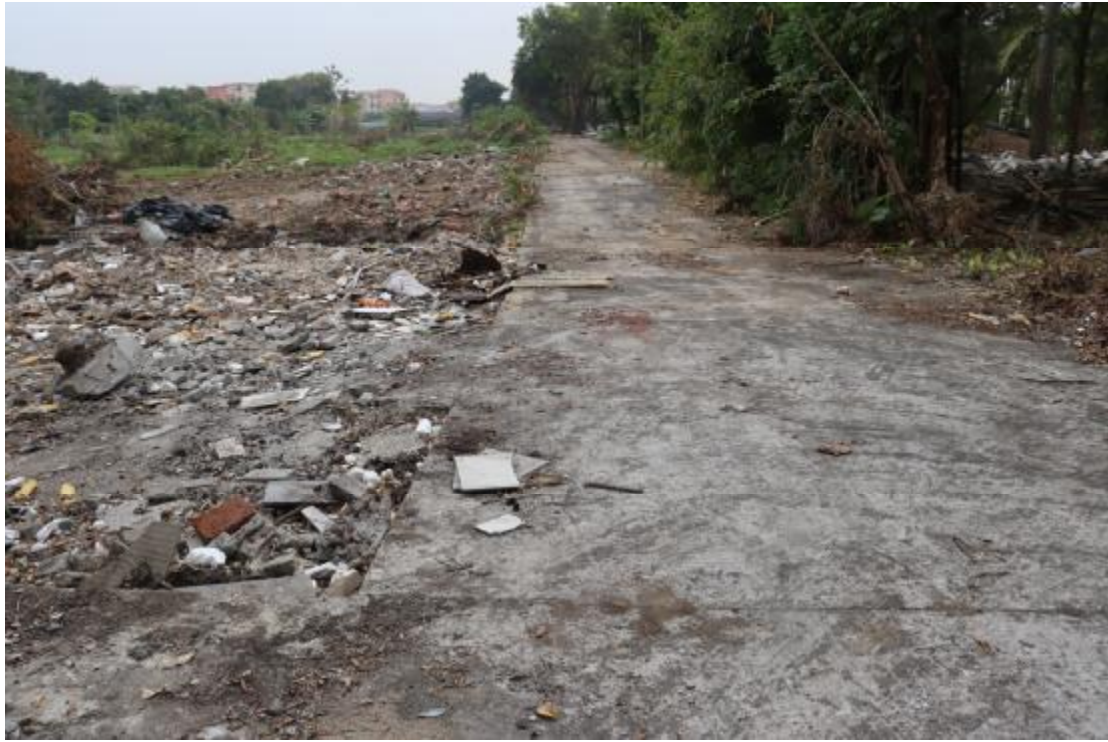
图 15 地块内东部现状（北-南）