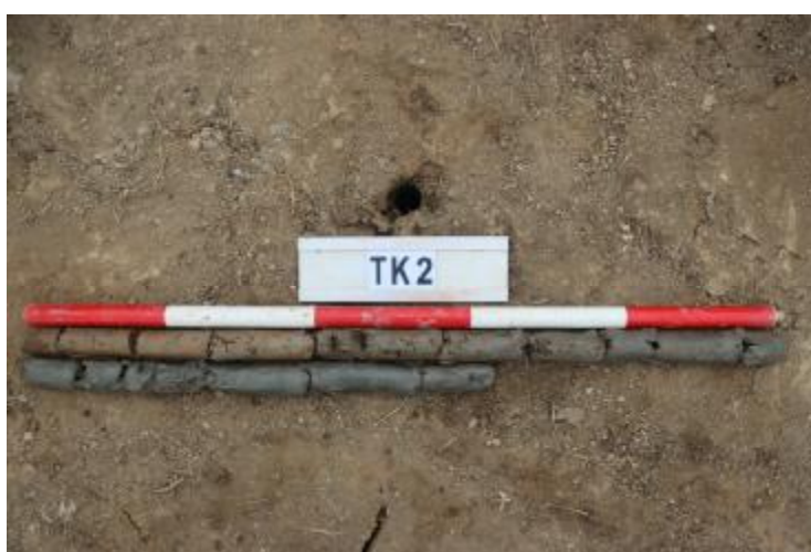
图 34 TK2 土样 (一米标杆, 土样由左上往右下)

②层: 淤积层, 距地表深 0.4-1.6 米, 厚 1.2 米, 为灰黑色淤泥, 土质较疏松, 无明显包含物。以下渗水严重, 无法提取土样。