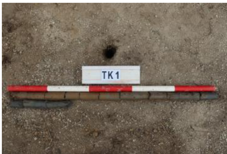
图 33 TK1 土样 (一米标杆, 土样由左上往右下)

②层: 淤积层, 距地表深 0.8-1.3 米, 厚 0.5 米, 为灰黑色淤泥, 土质较疏松, 无明显包含物。以下渗水严重, 无法提取土样。