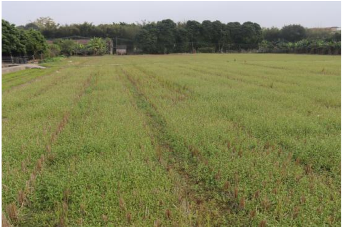
图 22 地块内东部现状（西-东）