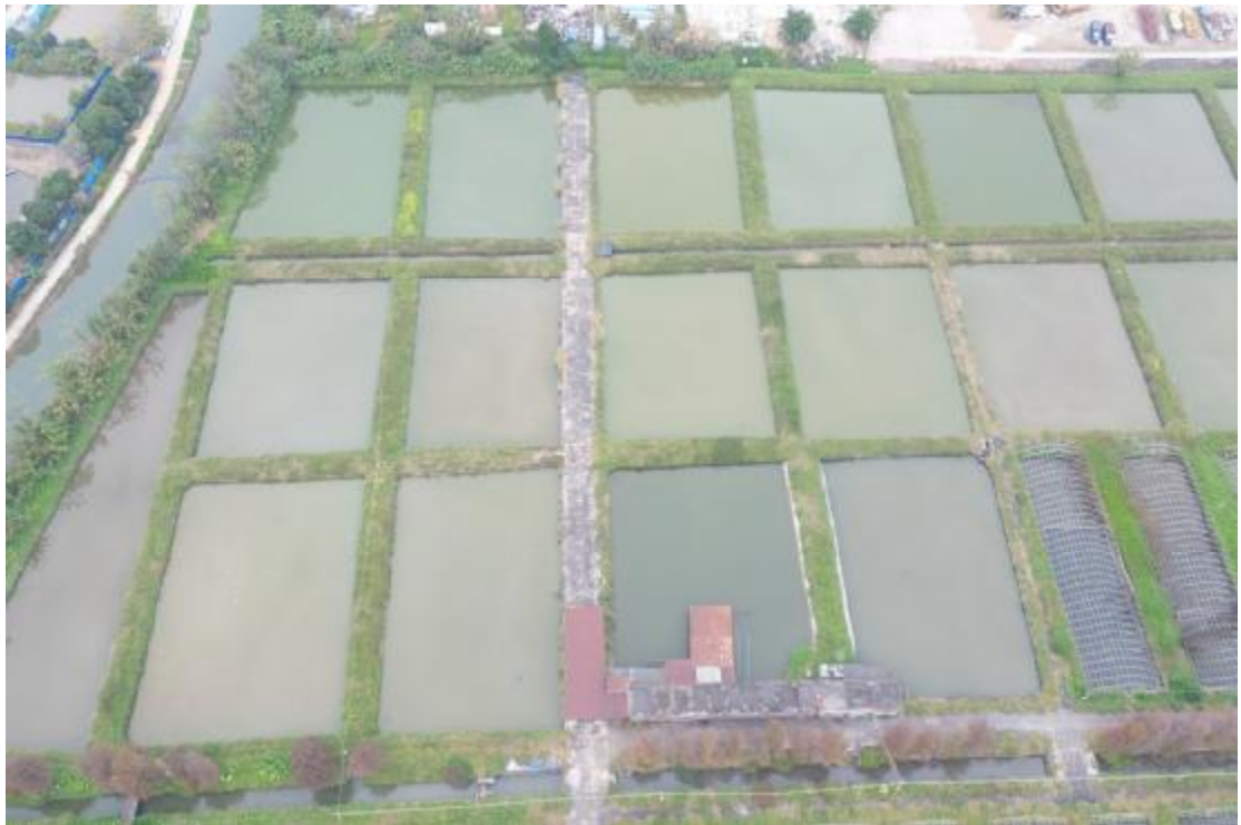
图 8 地块内北部现状（南-北）