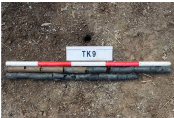
图 41 TK9 土样 (一米标杆, 土样由左上往右下)

②层: 淤积层, 距地表深 0.45-1.8 米, 厚 1.35 米, 为灰黑色淤泥, 土质较疏松, 无明显包含物。以下渗水严重, 无法提取土样。