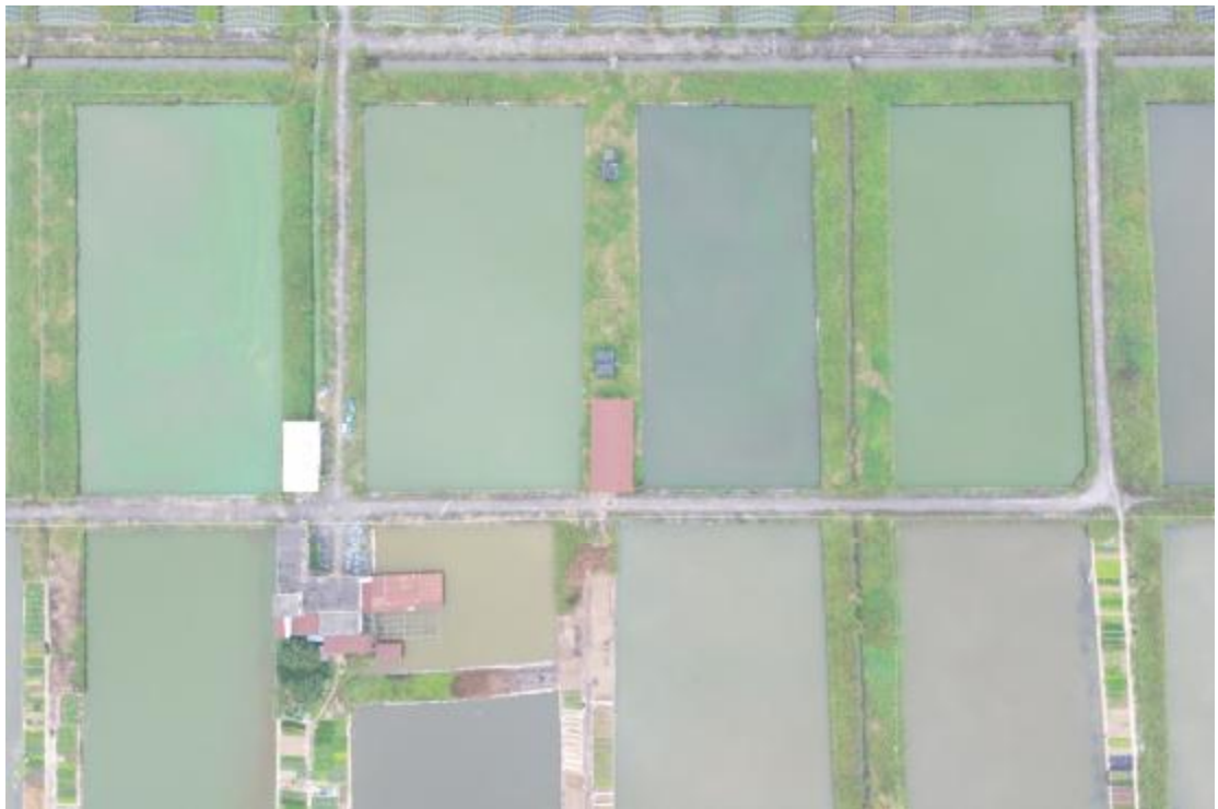
图 24 地块内南部现状（上北-下南）