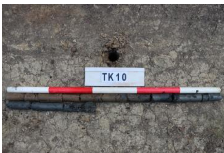
图 42 TK10 土样 (一米标杆, 土样由左上往右下)

②层: 淤积层, 距地表深 0.6-1.4 米, 厚 0.8 米, 为灰黑色淤泥, 土质较疏松, 无明显包含物。以下渗水严重, 无法提取土样。