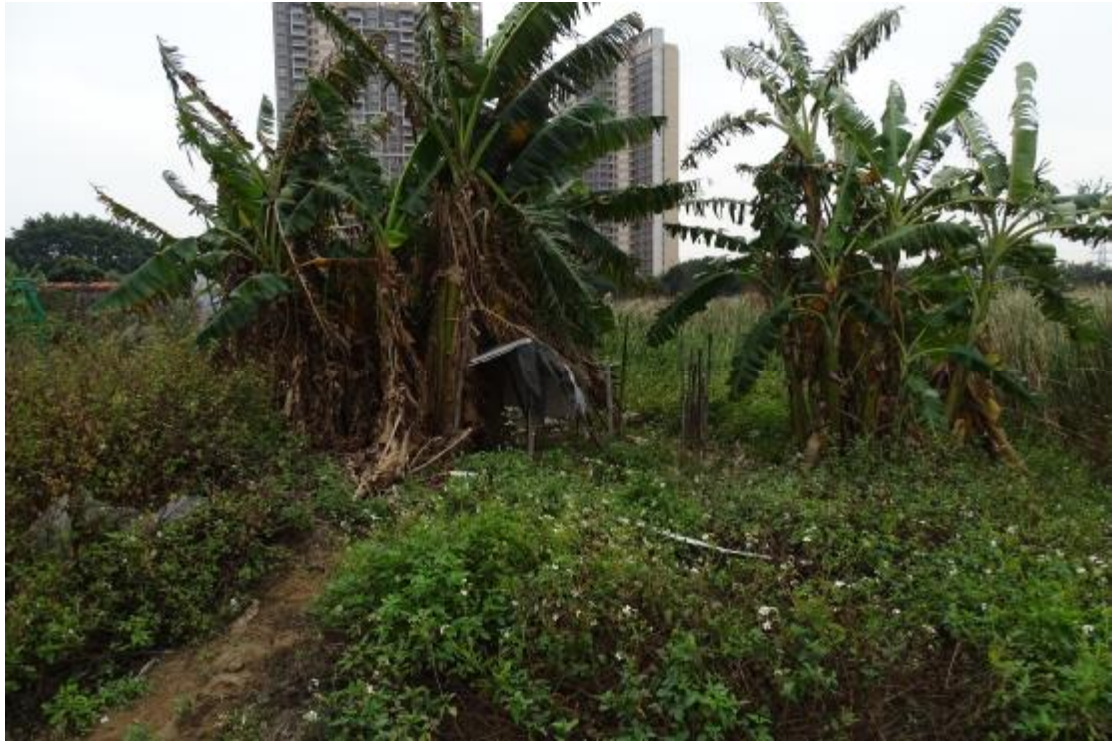
图 20 地表现状（北-南）