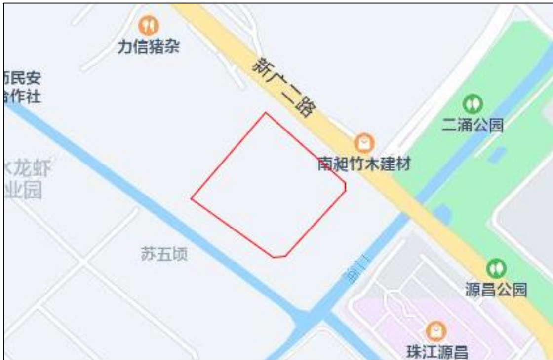
图 3 工程用地周边环境示意图