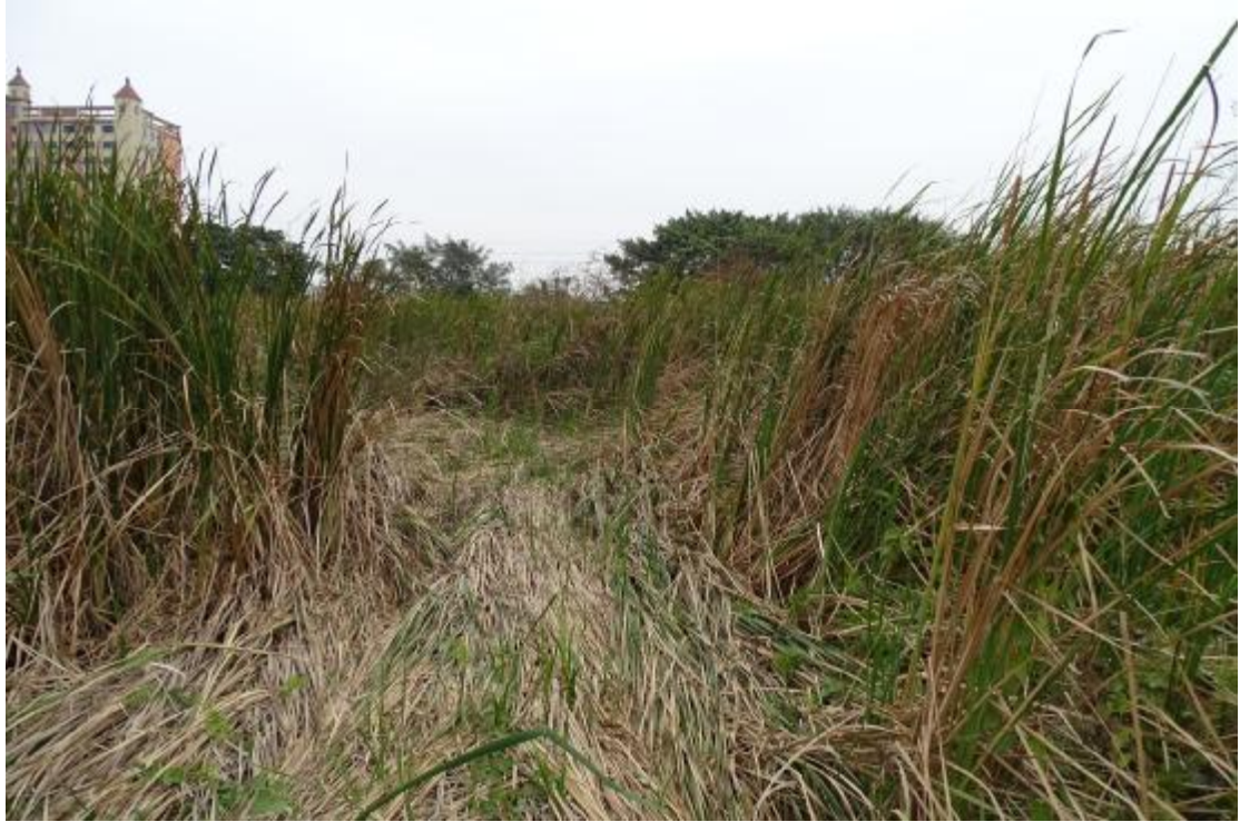
图 14 地表现状（西-东）