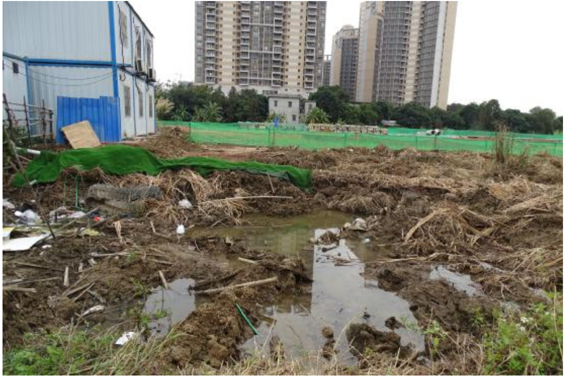
图 10 地表现状（南-北）