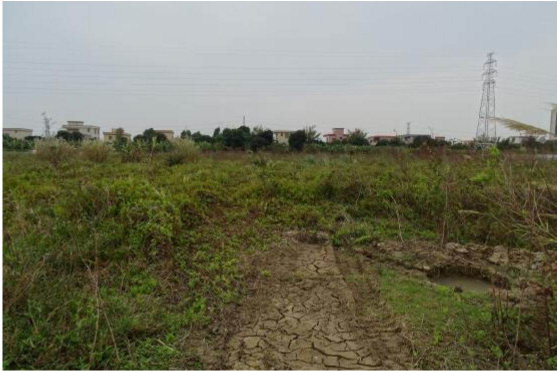
图 16 地表现状（东-西）