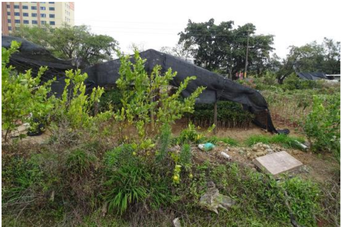
图 21 地表现状（西-东）