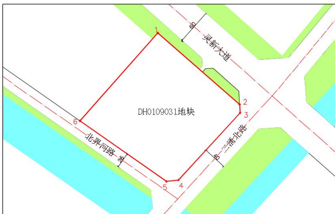
图 5 地块位置示意图