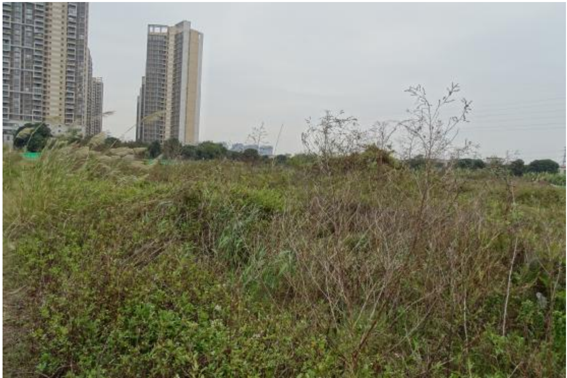
图 15 地表现状（北-南）