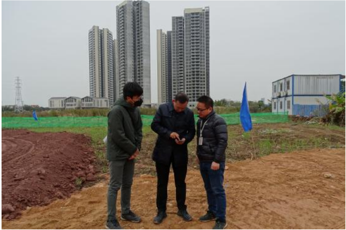
图 6 与现场工作人员确定地块范围（南-北）