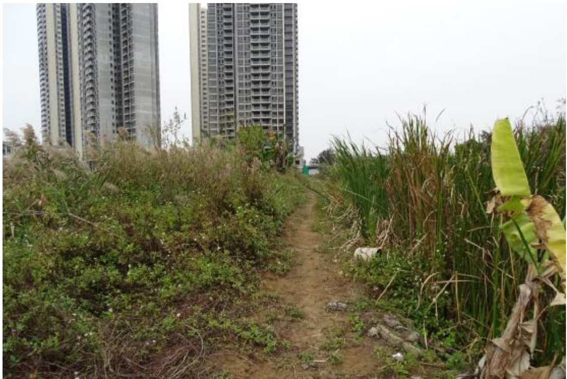
图 13 地表现状（北-南）