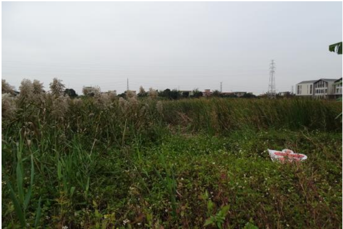
图 19 地表现状（西-东）