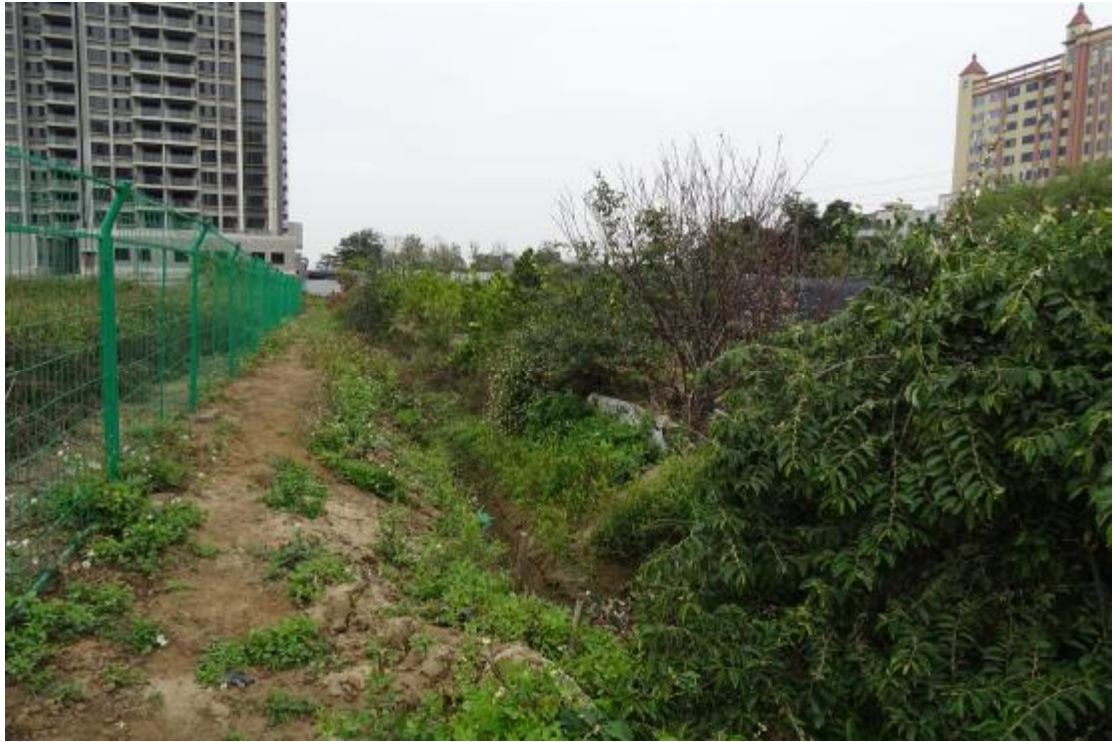
图 22 地表现状（北-南）