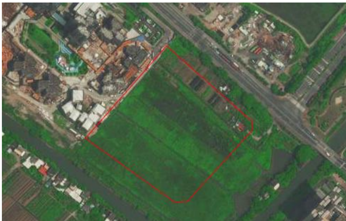
图 4 工程用地卫星红线图（高德地图）