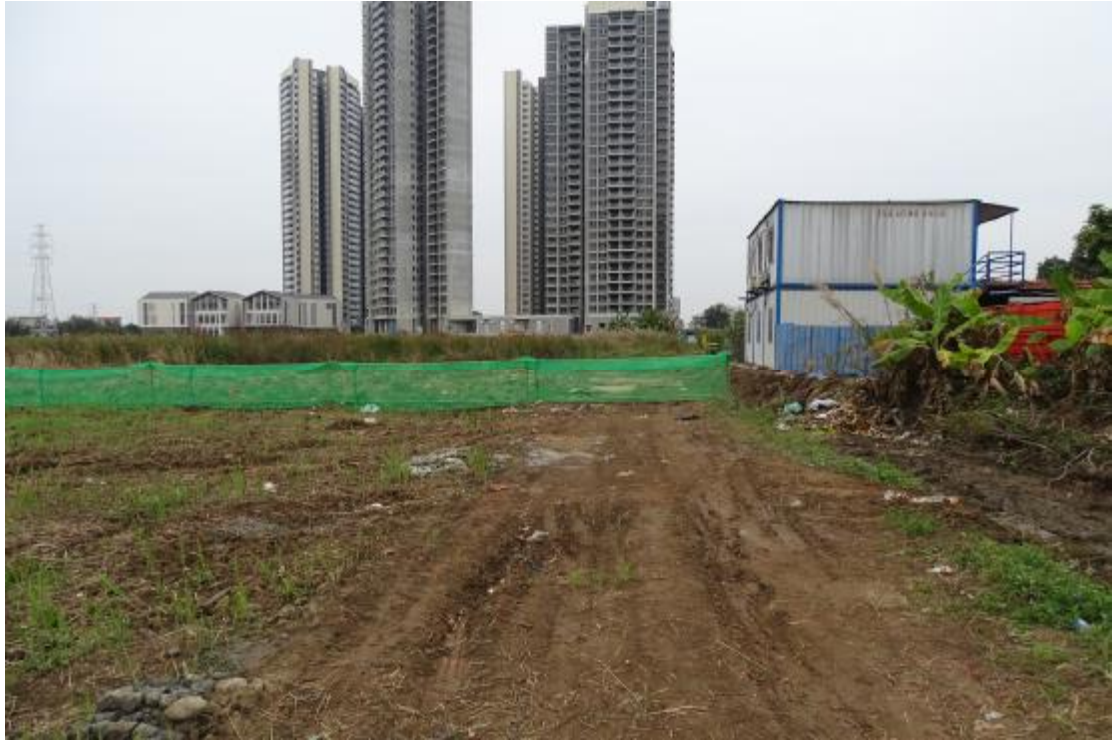
图 8 地表现状（北-南）