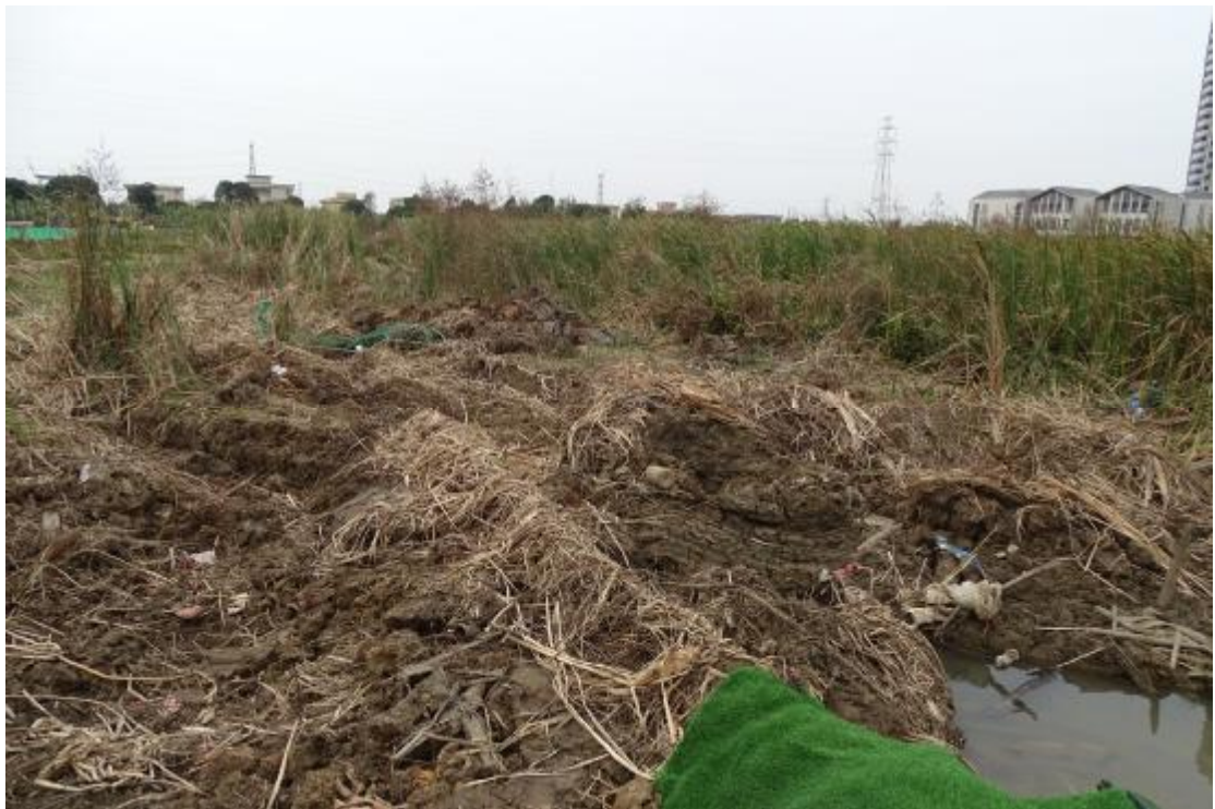
图 9 地表现状（东-西）