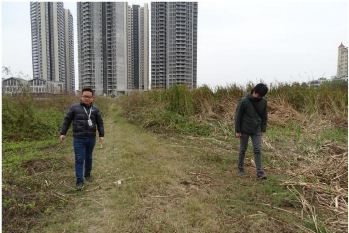
图 7 对地块地表进行踏查（南-北）