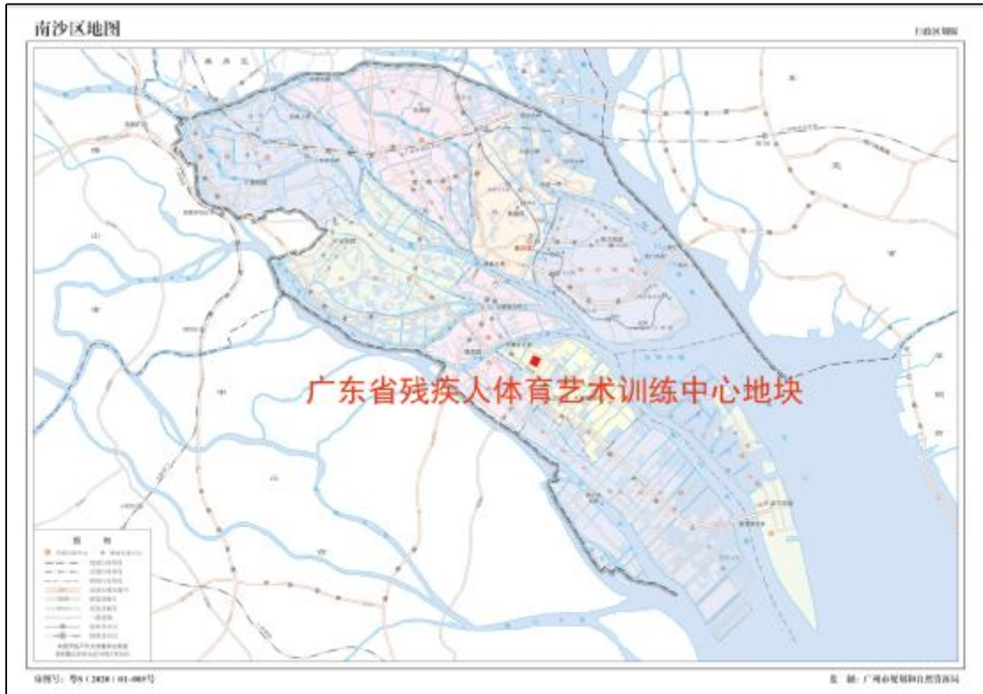
图 2 工程用地在南沙区的位置示意图（广州市规划和自然资源局）