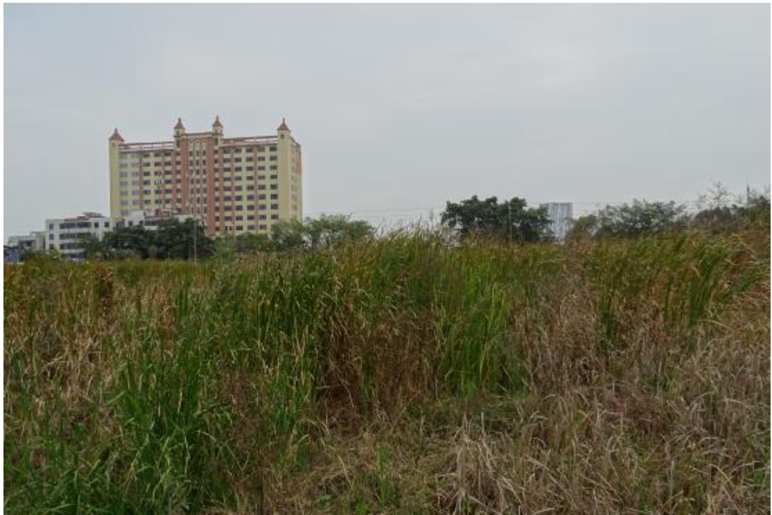
图 17 地表现状（西-东）