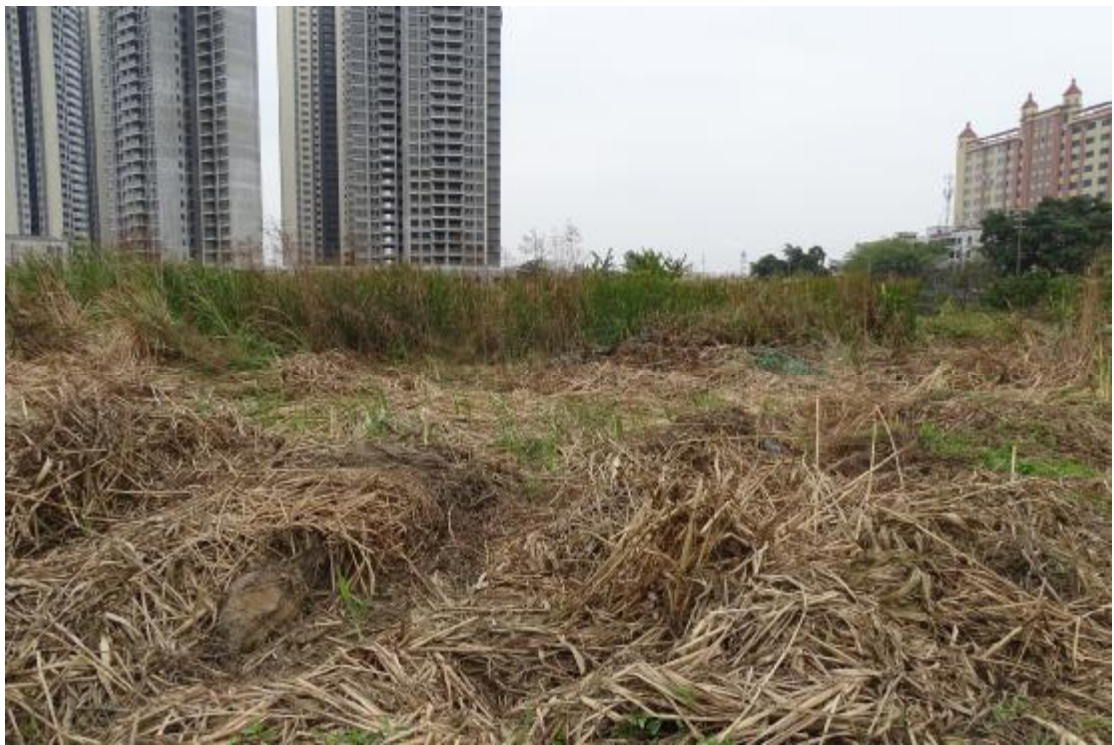
图 23 地表现状（南-北）