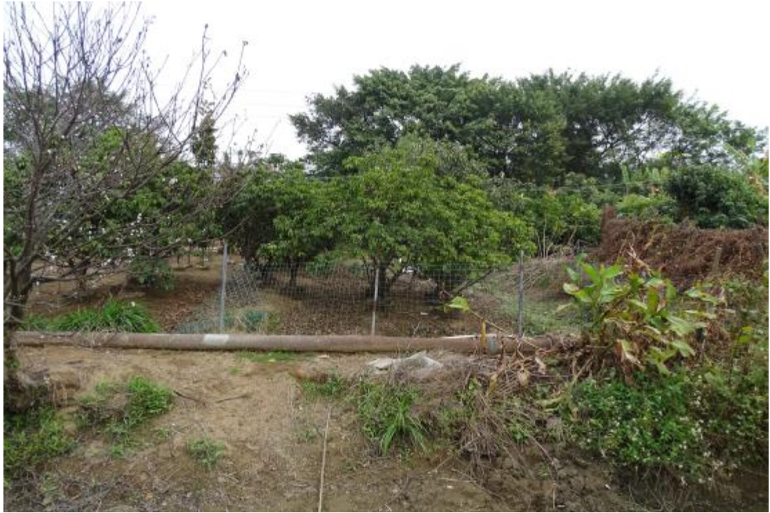
图 12 地表现状（西-东）