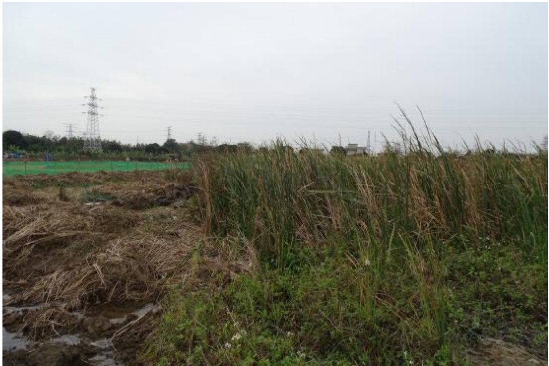
图 11 地表现状（东-西）