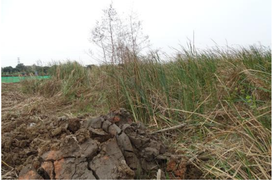
图 18 地表现状（东-西）