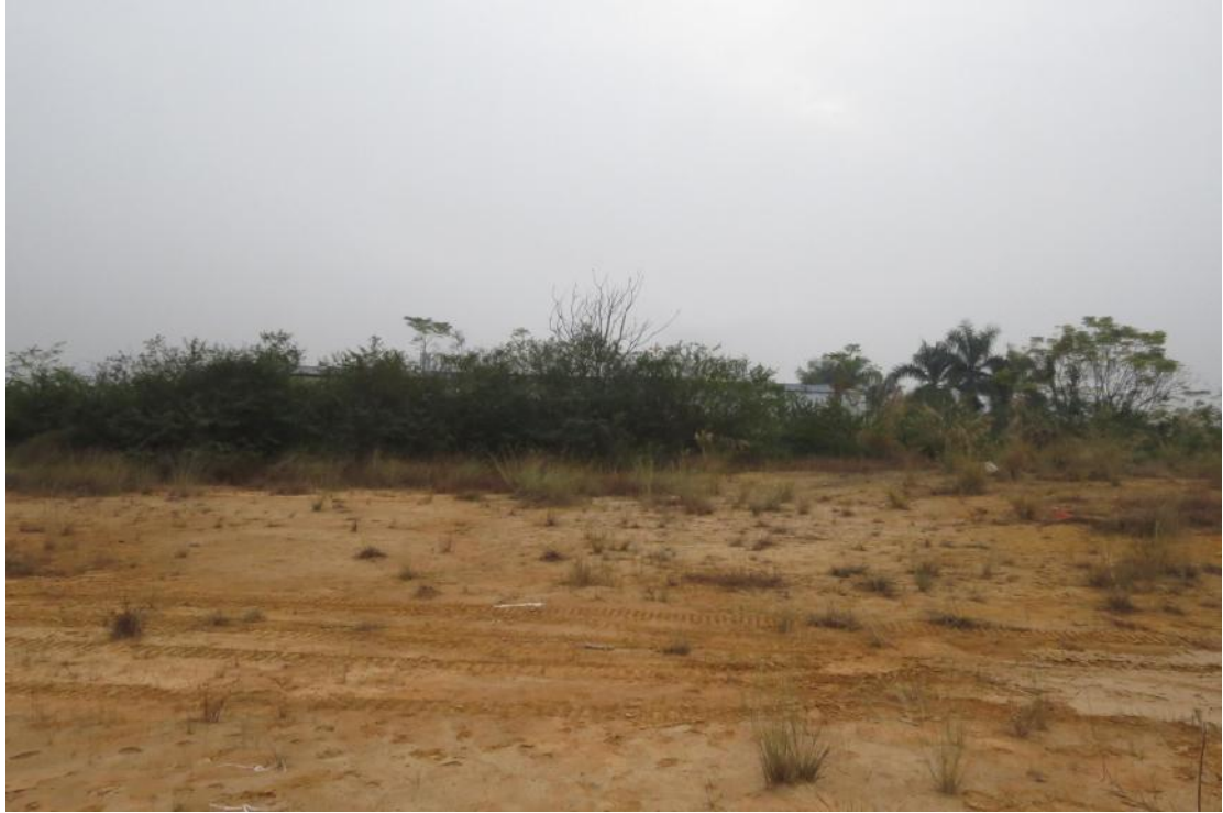
图 34 地块内南部现状（西-东）