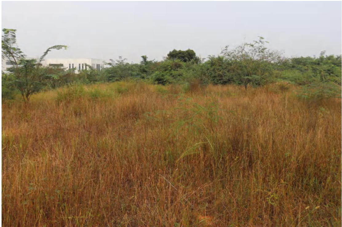
图 31 地块内中部现状（南-北）