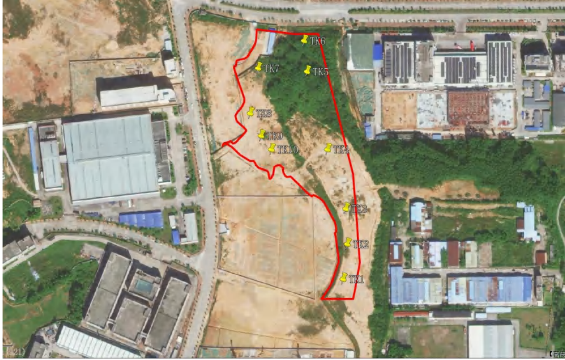
图 40 标准型探孔位置分布图(黄色标记点)

为进一步了解并掌握该地块内地层堆积情况，我们在地块范围内进行了试探。选取 12 个标准型探孔，编号为 TK1-TK12，具体情况如下：