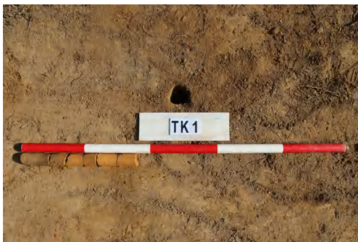
图 44 TK1 土样（一米标杆，土样由左往右）

①层：表土层，距地表深 0-0.2 米，厚 0.2 米，为灰褐色黏土，土质疏松，含植物根系、砂砾。以下为黄褐色黏土，土质致密、纯净，系生土。