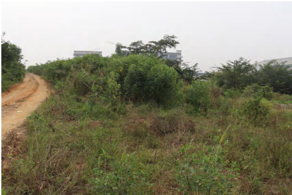
图 17 地块内北部现状(北-南)