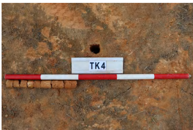
图 47 TK4 土样（一米标杆，土样由左往右）

①层：表土层，距地表深 0-0.05 米，厚 0.05 米，为灰褐色黏土，土质疏松，含植物根系、砂砾。以下为红褐色黏土，土质致密、纯净，系生土。