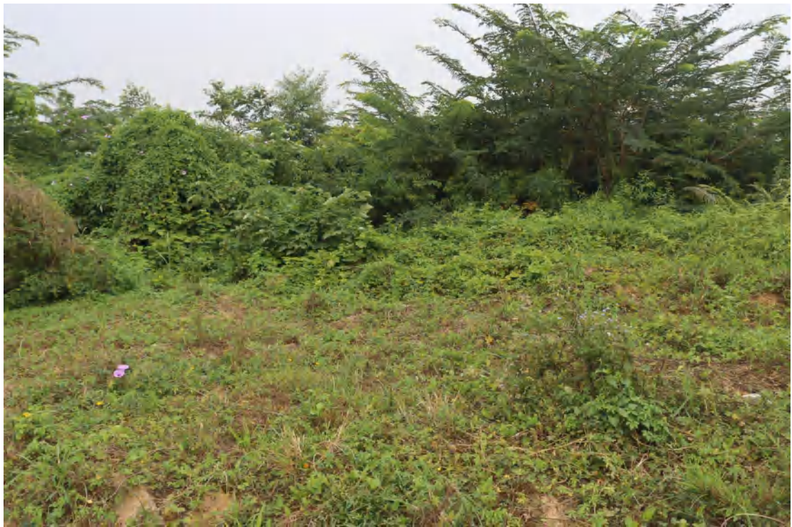
图 23 地块内北部现状（南-北）