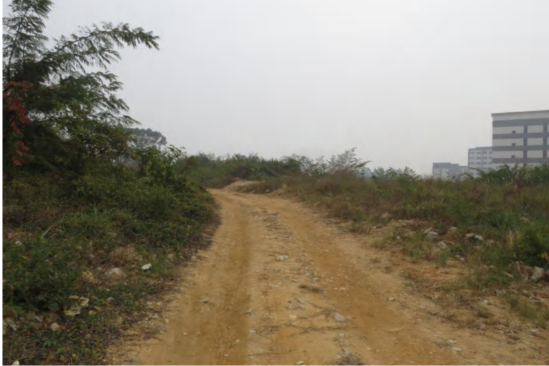
图 16 地块内北部现状(北-南)