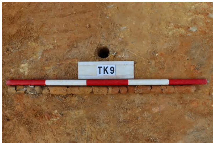
图 52 TK9 土样（一米标杆，土样由左往右）

①层：垫土层，距地表深 0-0.65 米，厚 0.65 米，为灰黄色黏土，土质较疏松，含植物根系、砂砾。以下为黄褐色黏土，土质致密、纯净，系生土。