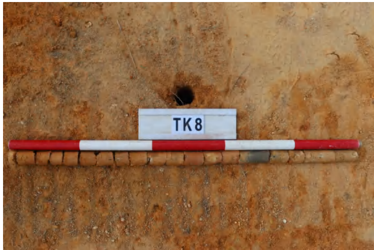
图 51 TK8 土样（一米标杆，土样由左往右）

①层：垫土层，距地表深 0-0.8 米，厚 0.8 米，为灰黄色黏土，土质较疏松，含植物根系、砂砾。以下为黄褐色黏土，土质致密、纯净，系生土。