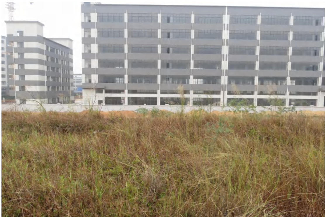
图 37 地块内南部现状（东-西）