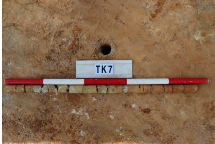
图 50 TK7 土样（一米标杆，土样由左往右）

①层：垫土层，距地表深 0-0.95 米，厚 0.95 米，为灰黄色黏土，土质较疏松，含植物根系、石子。以下有大石块，无法继续提取土样。