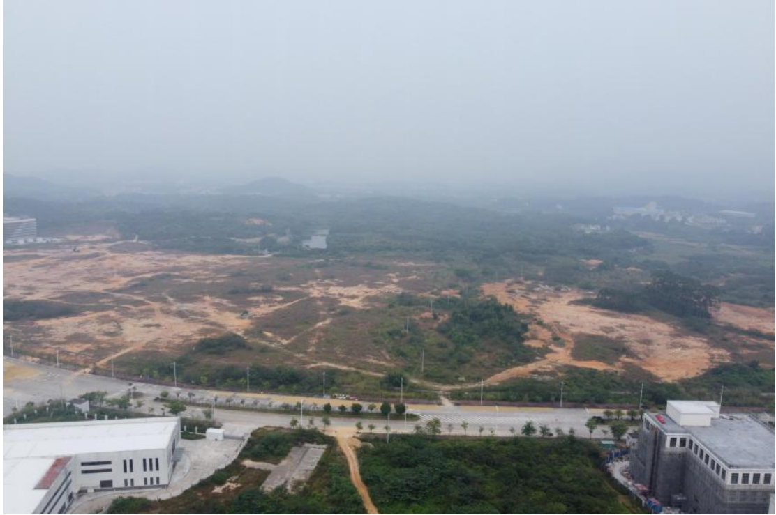
图 10 地块外北部地形地貌（南-北）