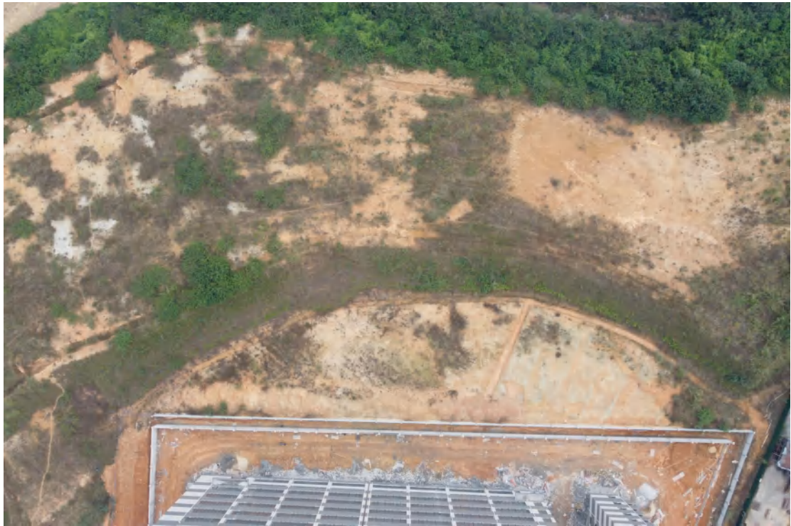
图 33 地块内南部现状（上东-下西）