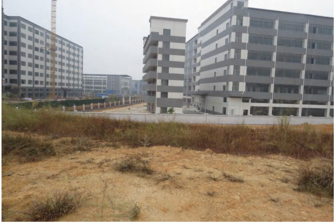
图 36 地块内南部现状（东-西）