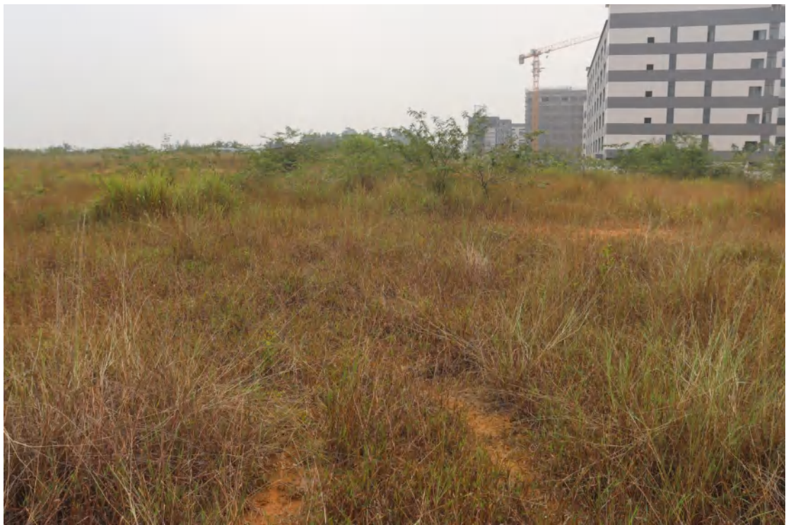
图 27 地块内中部现状（北-南）