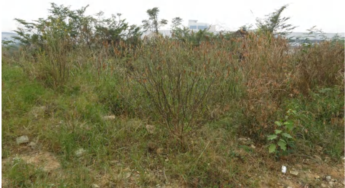
图 19 地块内北部现状(东-西)