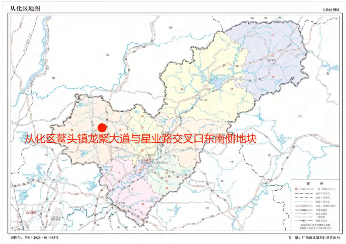
图 2 项目地块在从化区位置示意图（广州市规划和自然资源局）