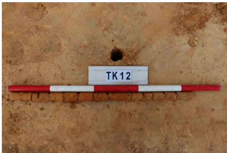
图 53 TK12 土样（一米标杆，土样由左往右）

①层：垫土层，距地表深 0-0.6 米，厚 0.6 米，为灰黄色黏土，土质较疏松，含植物根系、砂砾。以下为黄褐色黏土，土质致密、纯净，系生土。