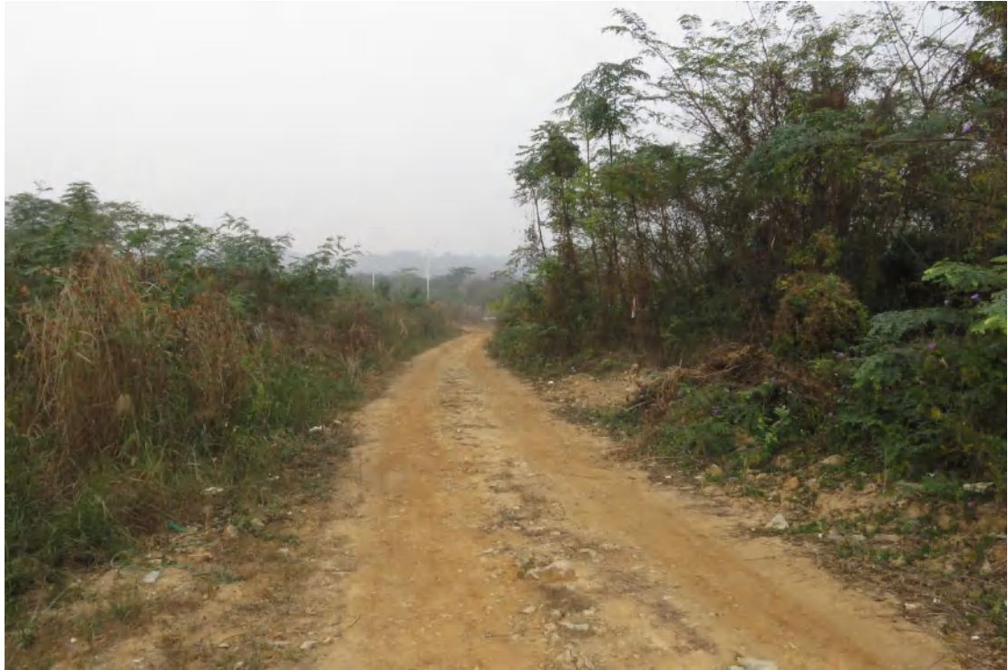
图 22 地块内北部现状（南-北）