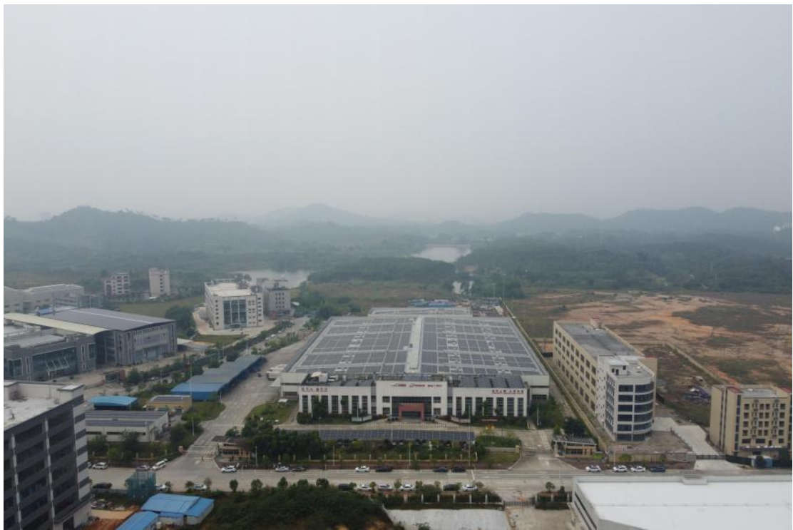
图 13 地块外西部地形地貌（东-西）