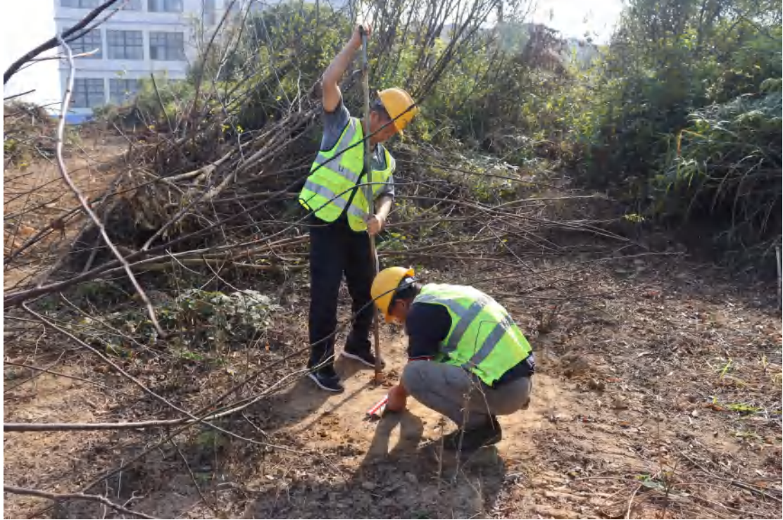
图 42 试探孔提取土样工作照（西北-东南）