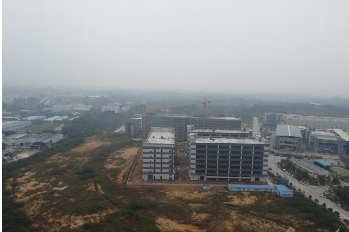
图 12 地块外南部地形地貌（北-南）