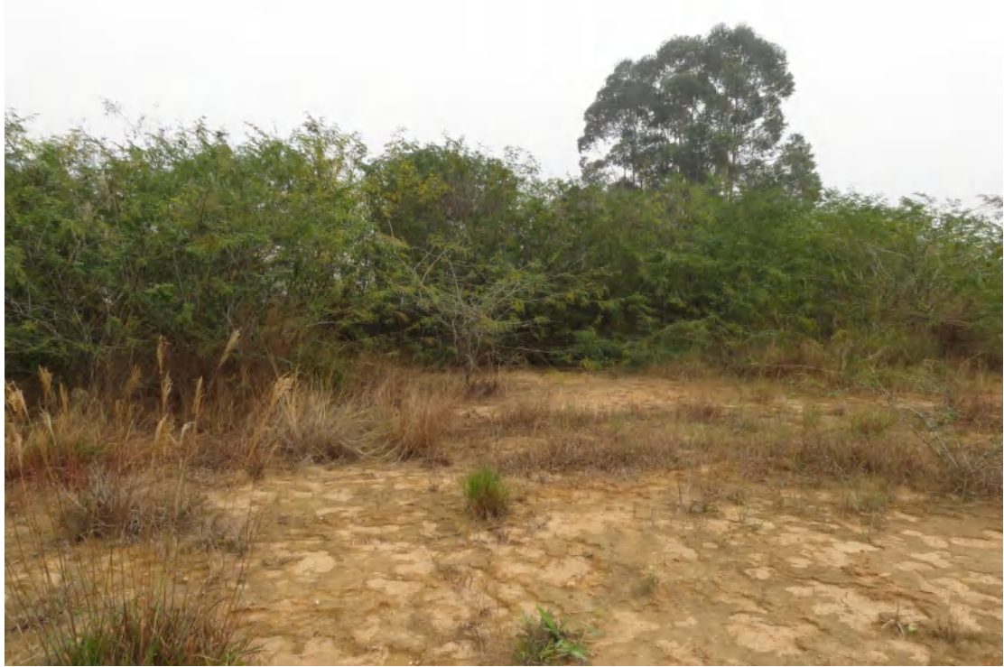
图 32 地块内中部现状（西-东）