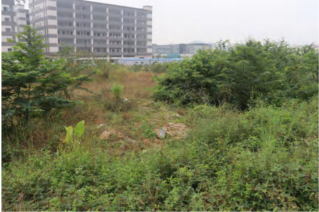
图 28 地块内中部现状（东北-西南）