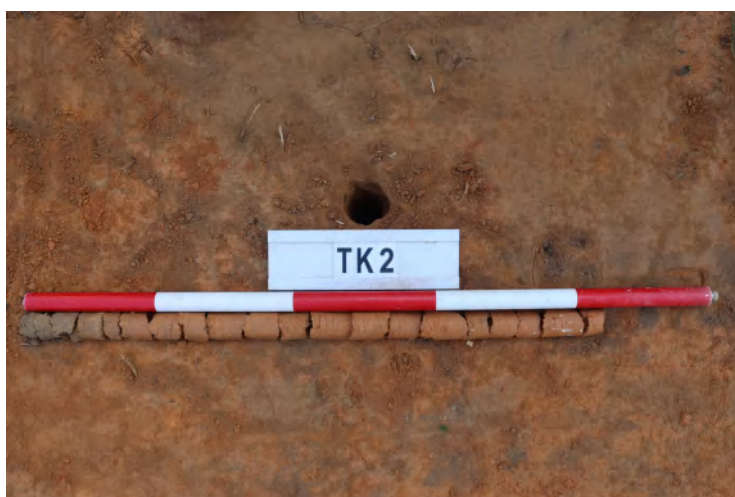
图 45 TK2 土样（一米标杆，土样由左往右）

①层：表土层，距地表深 0-0.15 米，厚 0.15 米，为灰褐色黏土，土质疏松，含植物根系、砂砾。以下为红褐色黏土，土质致密、纯净，系生土。