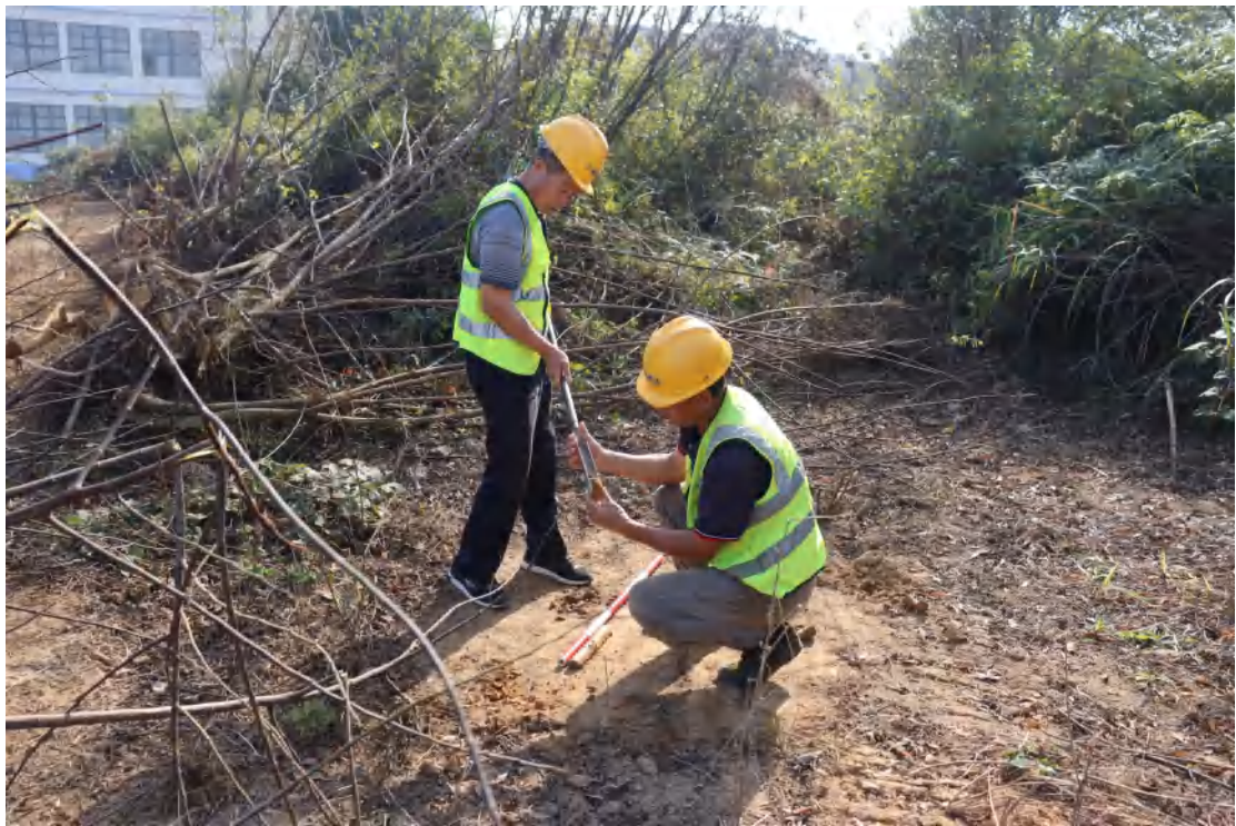
图 43 试探孔分析土样工作照（西北-东南）