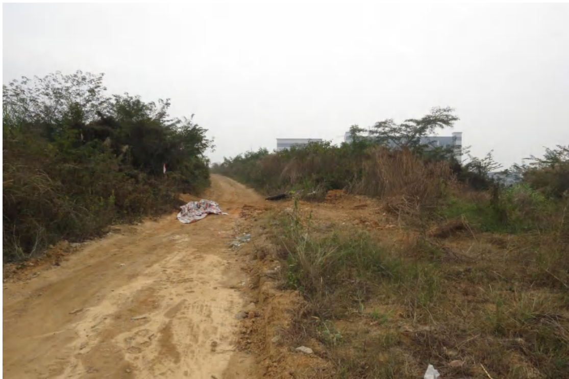
图 15 地块内北部现状（北-南）