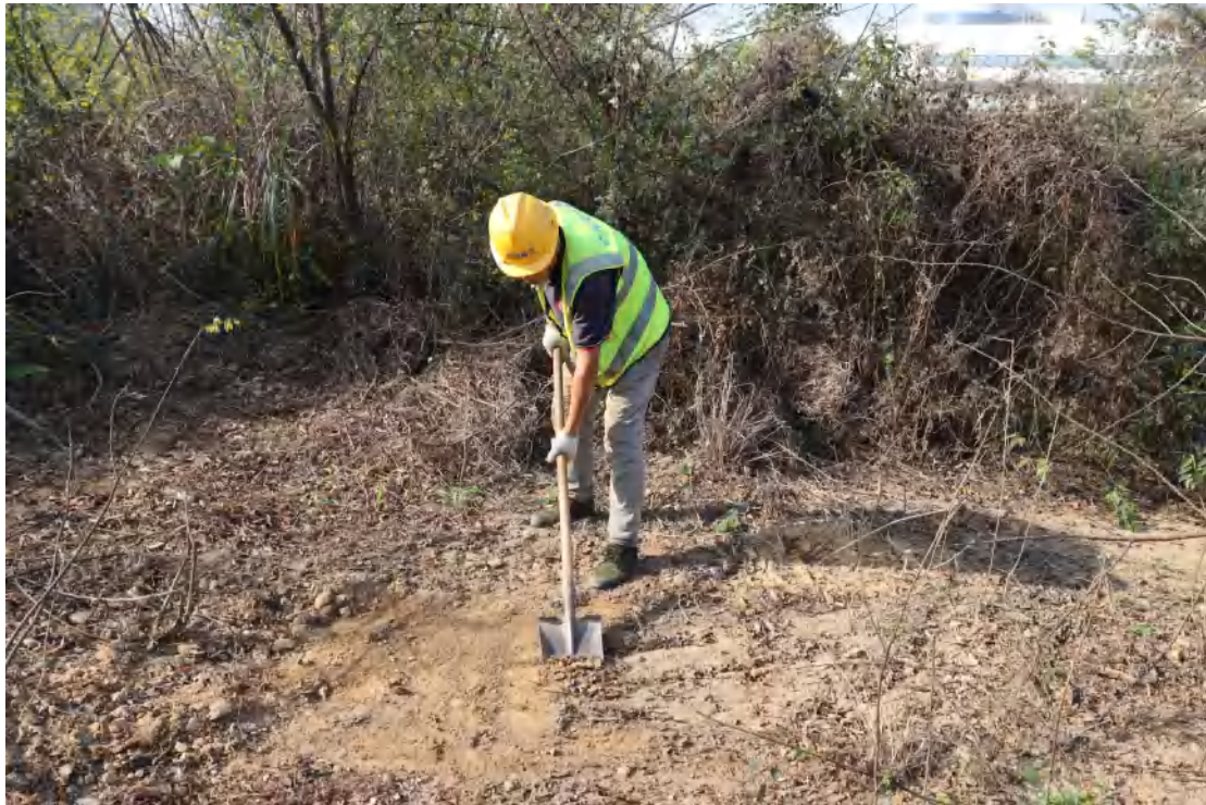
图 41 试探孔清表工作照(东北-西南)