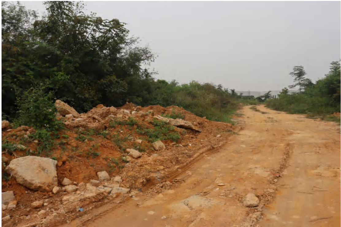
图 29 地块内中部现状（东-西）