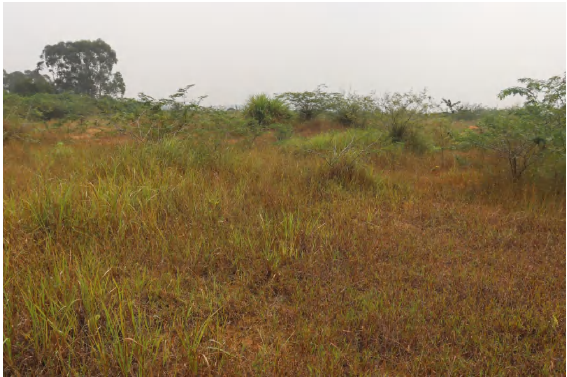
图 39 地块内南部现状（西北-东南）