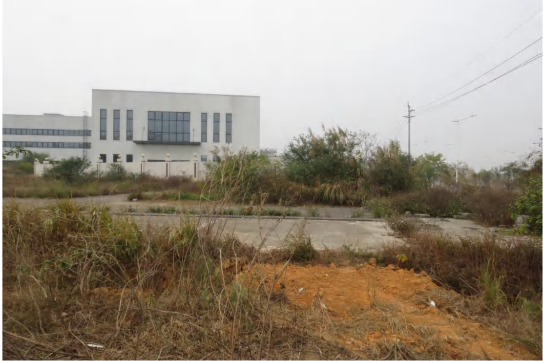
图 18 地块内北部现状(东-西)