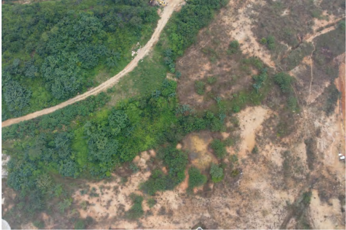
图 26 地块内中部现状（上东下西）