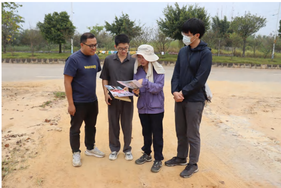
图 7 工作人员确认地块范围（南-北）