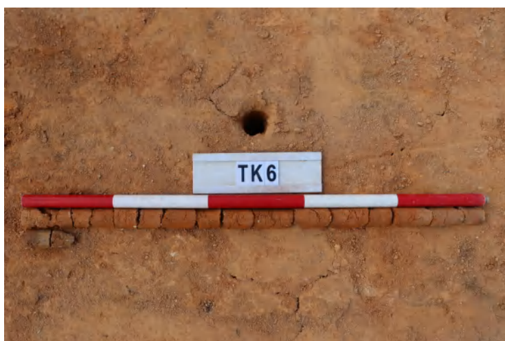
图 49 TK6 土样（一米标杆，土样由左往右）

①层：垫土层，距地表深 0-1.1 米，厚 1.1 米，为灰黄色黏土，土质较疏松，含植物根系、石子。以下有大石块，无法继续提取土样。