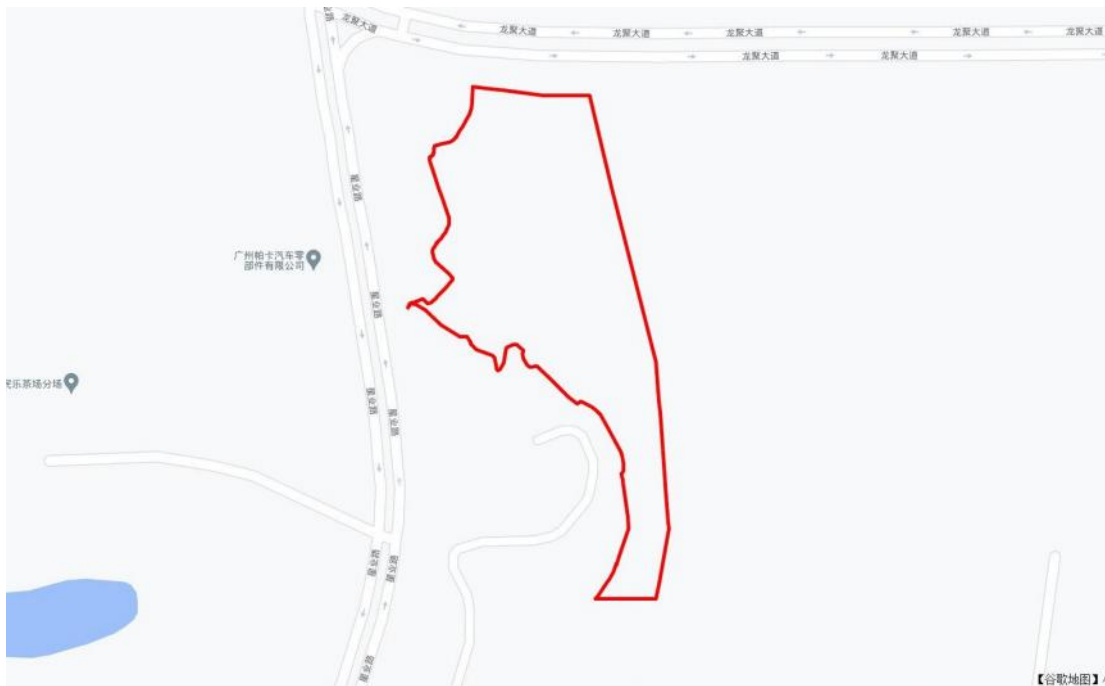
图 3 项目地块周边环境示意图（奥维地图）