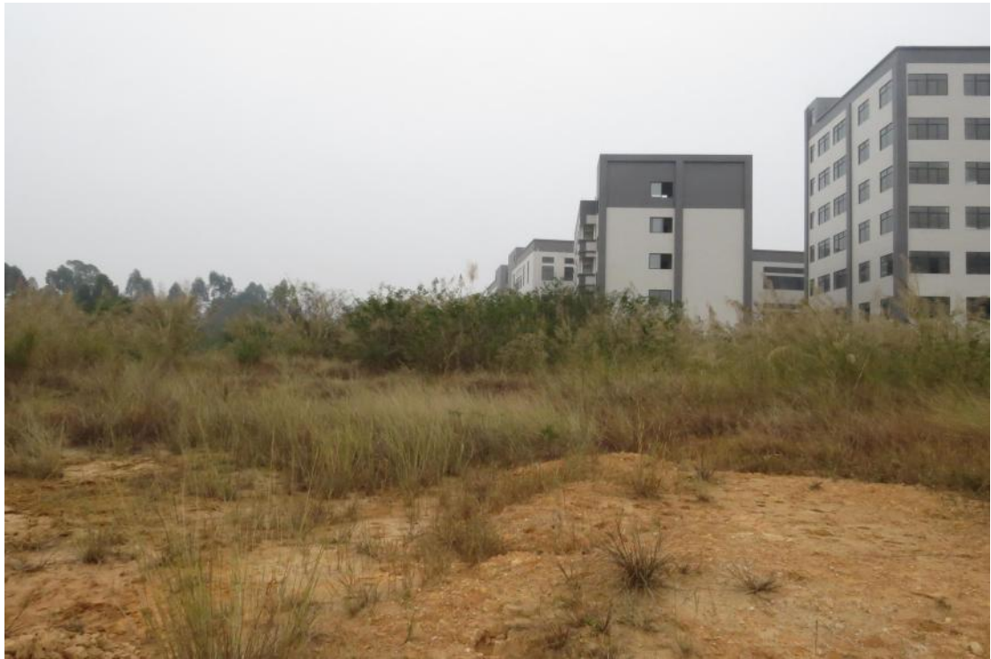
图 35 地块内南部现状（北-南）