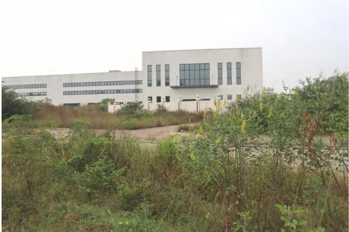
图 20 地块内北部现状(东-西)