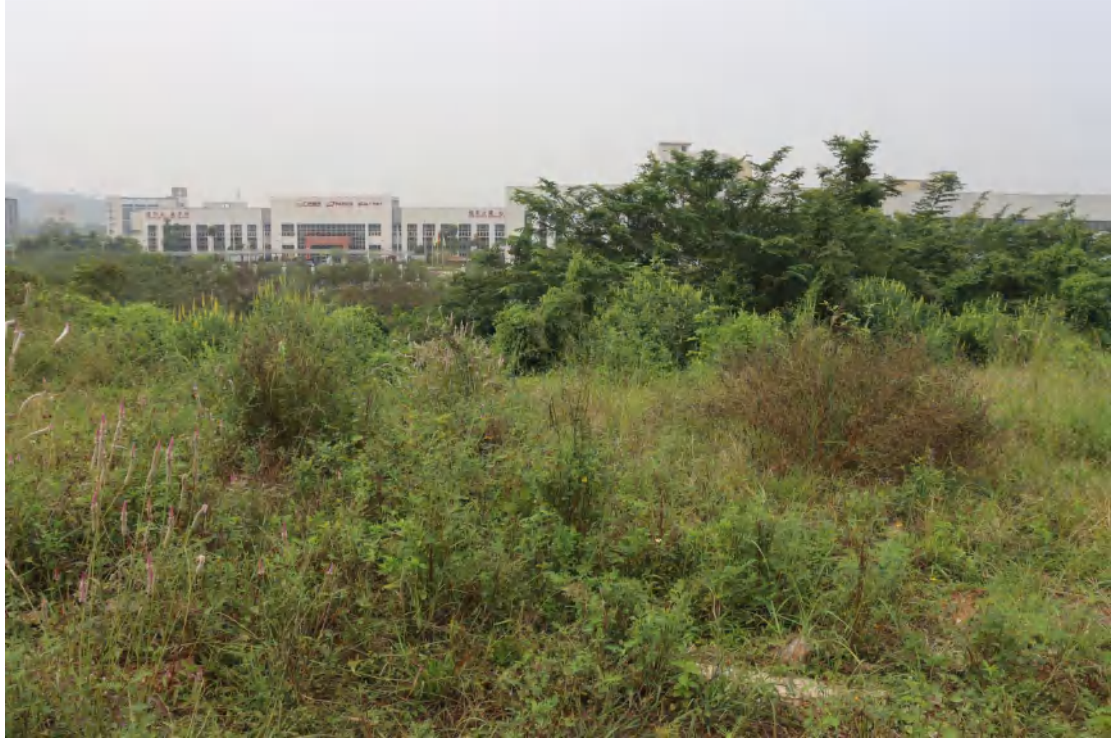
图 30 地块内中部现状（东-西）