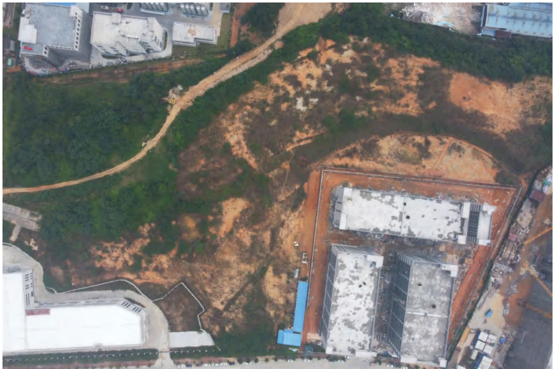
图 9 地块内全景（上西-下东）