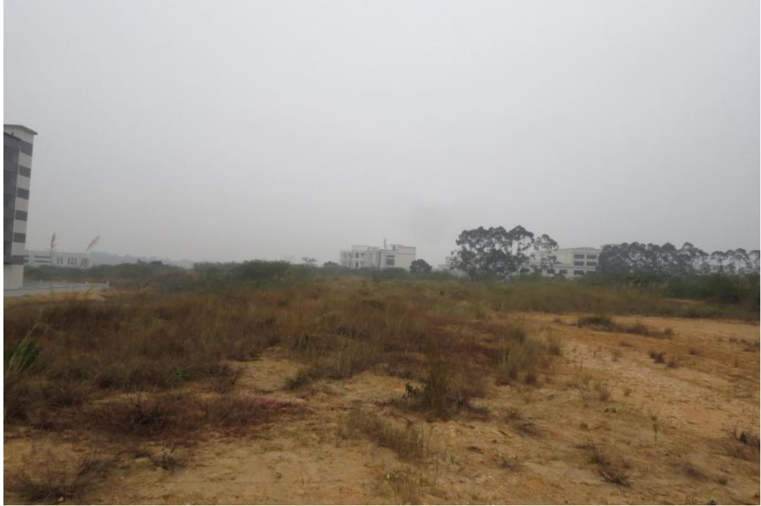
图 38 地块内南部现状（南-北）