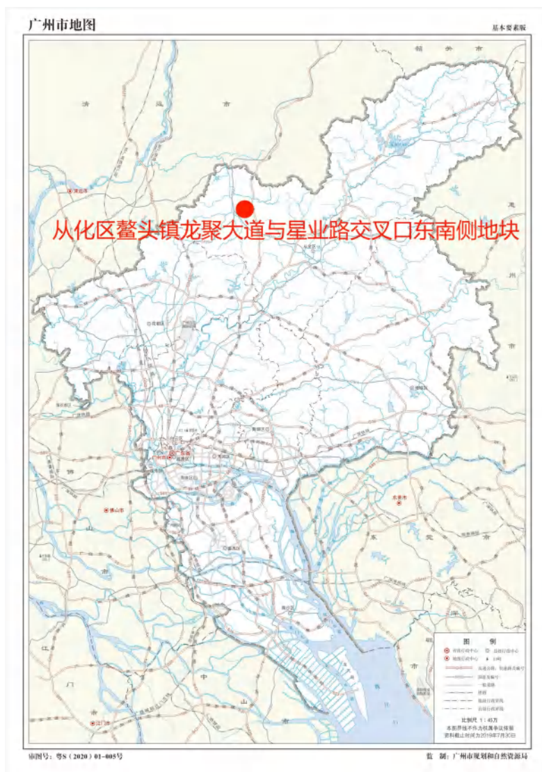
图 1 项目地块在广州市位置示意图（广州市规划和自然资源局）

根据《中华人民共和国文物保护法》《广州市文物保护规定》，按照《广州市文物局关于从化区鳌头镇龙聚大道与星业路交叉口东南侧地块考古调查勘探工作的复函》（文物 20231134 号）指导意见，受广州市从化区土地储备开发中心委托，由我院负责该项目的考古调查工作。