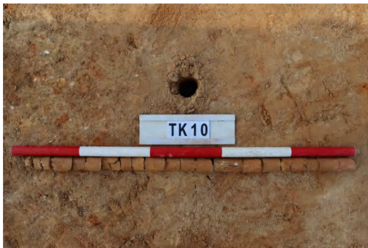
图 53 TK10 土样（一米标杆，土样由左往右）

①层：垫土层，距地表深 0-0.65 米，厚 0.65 米，为灰黄色黏土，土质较疏松，含植物根系、砂砾。以下为黄褐色黏土，土质致密、纯净，系生土。