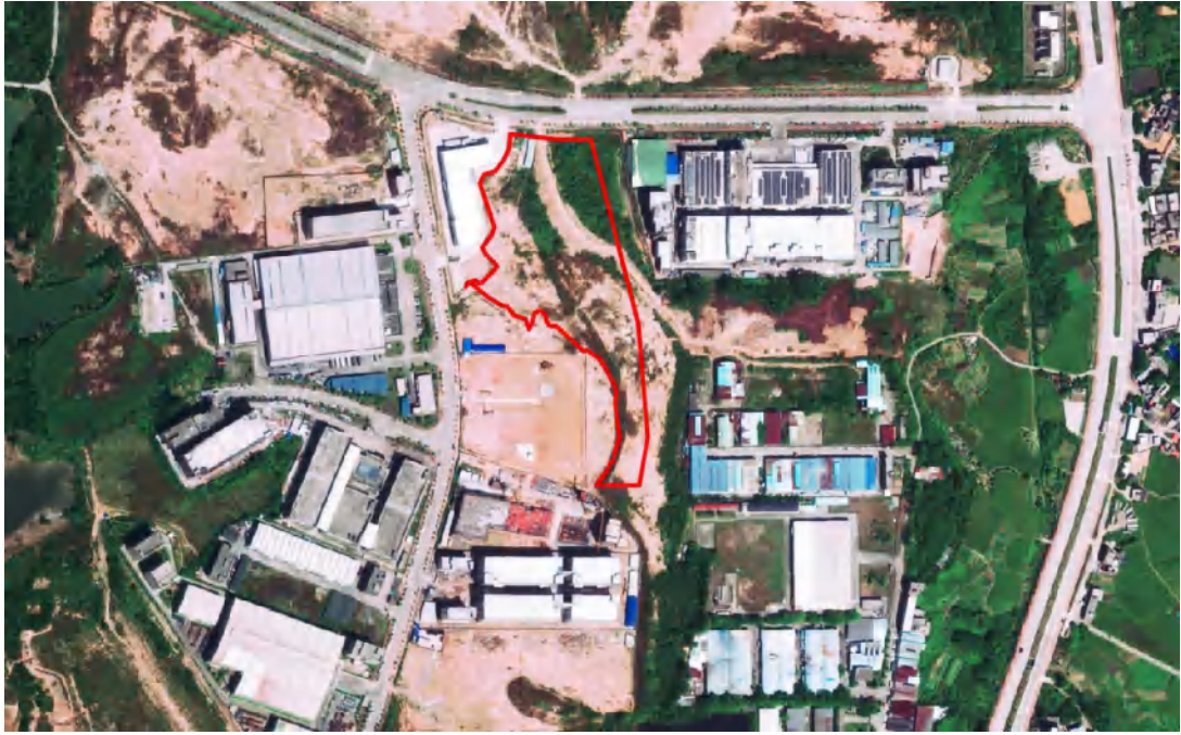
图 4 项目地块卫星红线图