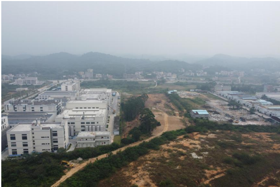
图 11 地块外东部地形地貌（西-东）