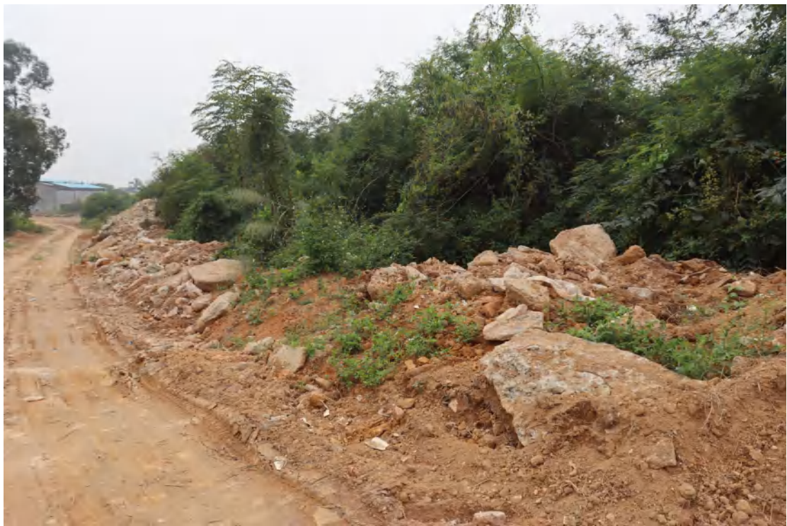
图 25 地块内东部现状（北-南）