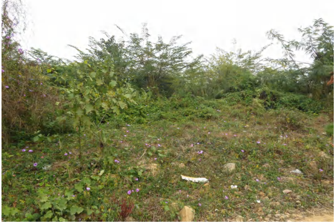
图 24 地块内北部现状（西-东）