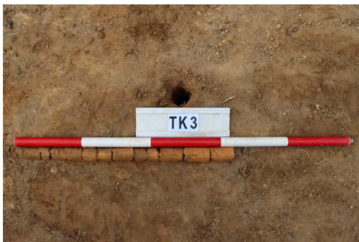
图 46 TK3 土样（一米标杆，土样由左往右）

①层：垫土层，距地表深 0-0.45 米，厚 0.45 米，为灰黄色黏土，土质较疏松，含植物根系、石子。以下为黄褐色黏土，土质致密、纯净，系生土。