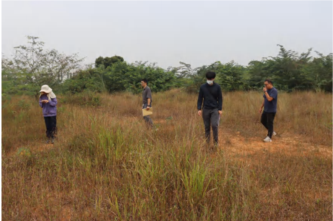
图 8 现场踏查（东南-西北）