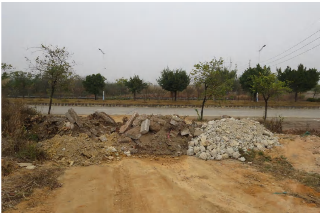
图 21 地块内北部现状(南-北)