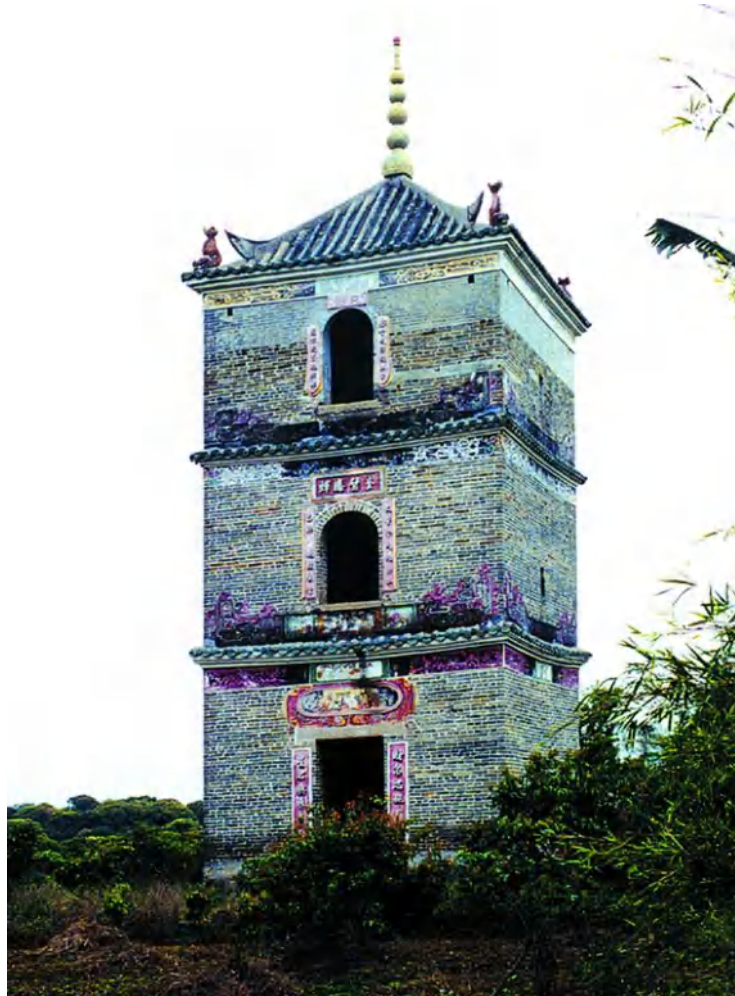
图 6 文昌塔

昌塑像。第二层财帛星君楼，内敬祀财帛星偶像。财帛星君乃管财富的神。第三层是魁星楼，拜奉魁星神像。现为从化区文物保护单位。