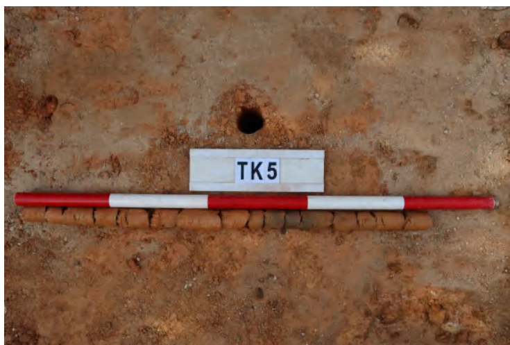
图 48 TK5 土样（一米标杆，土样由左往右）

①层：垫土层，距地表深 0-0.7 米，厚 0.7 米，为灰黄色黏土，土质较疏松，含植物根系、石子。以下为黄褐色黏土，土质致密、纯净，系生土。