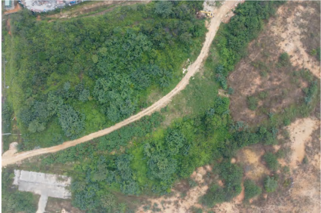
图 14 地块内北部现状（上东-下西）