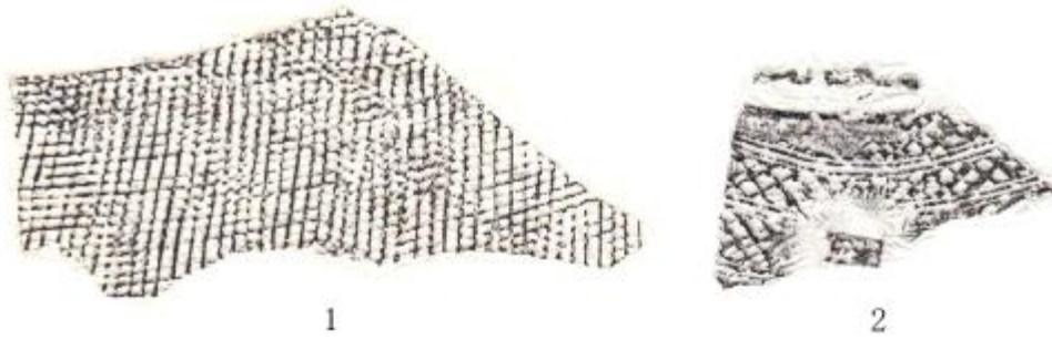
图 6 白藤涪遗址战国时期的陶片拓片 1. 方格纹 2. 方格加细凹弦纹