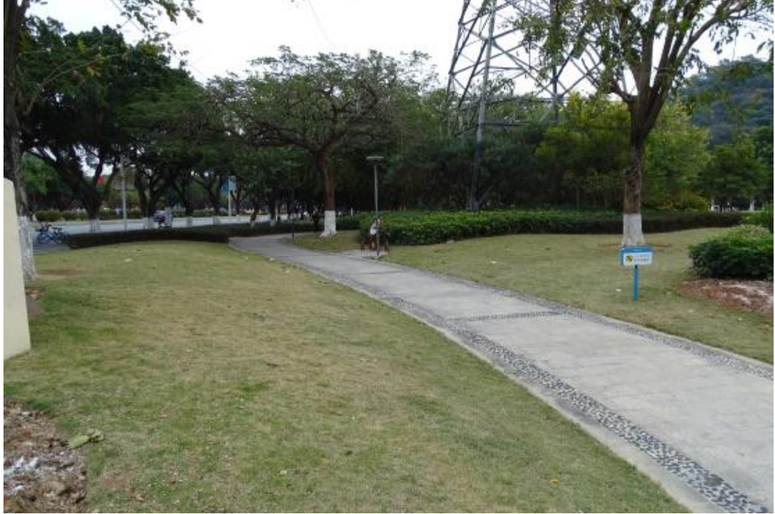
图 12 地表现状（西-东）