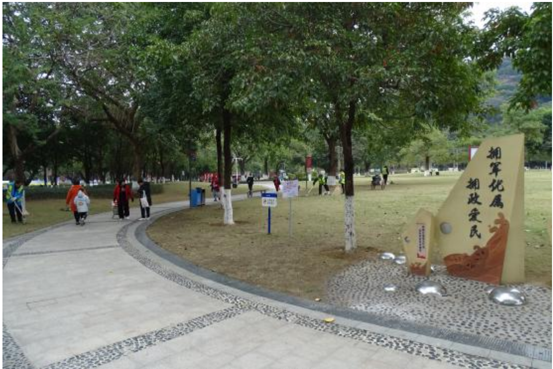
图 15 地表现状（西-东）