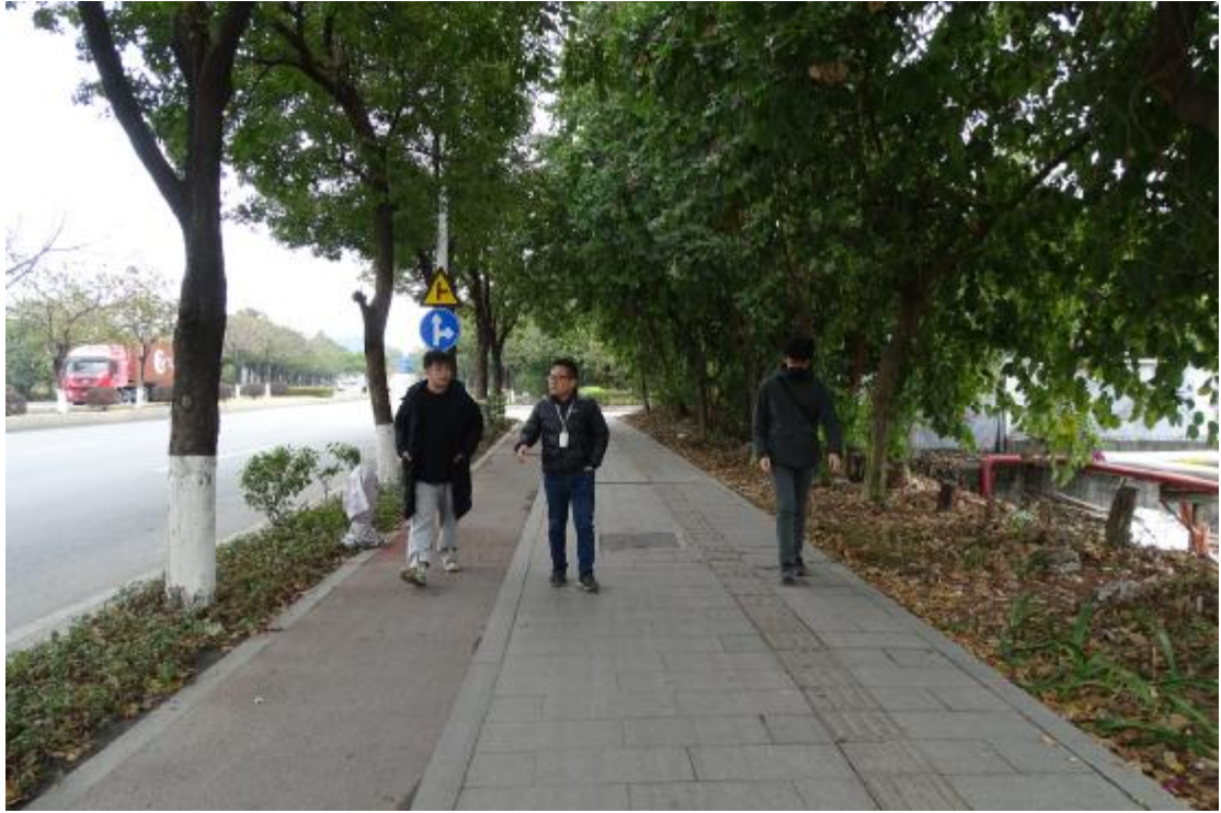
图 8 对地块地表进行踏查（北-南）