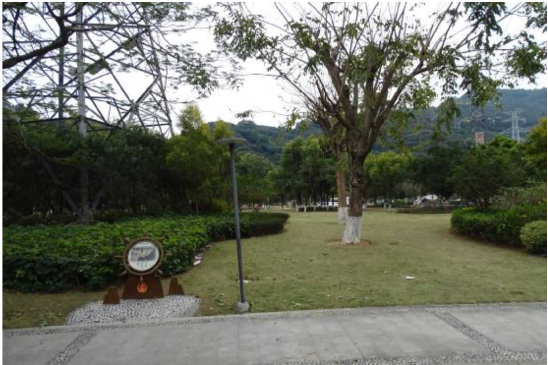
图 11 地表现状（北-南）