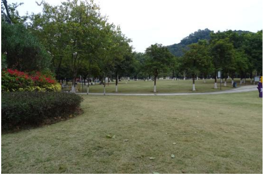
图 14 地表现状（西-东）