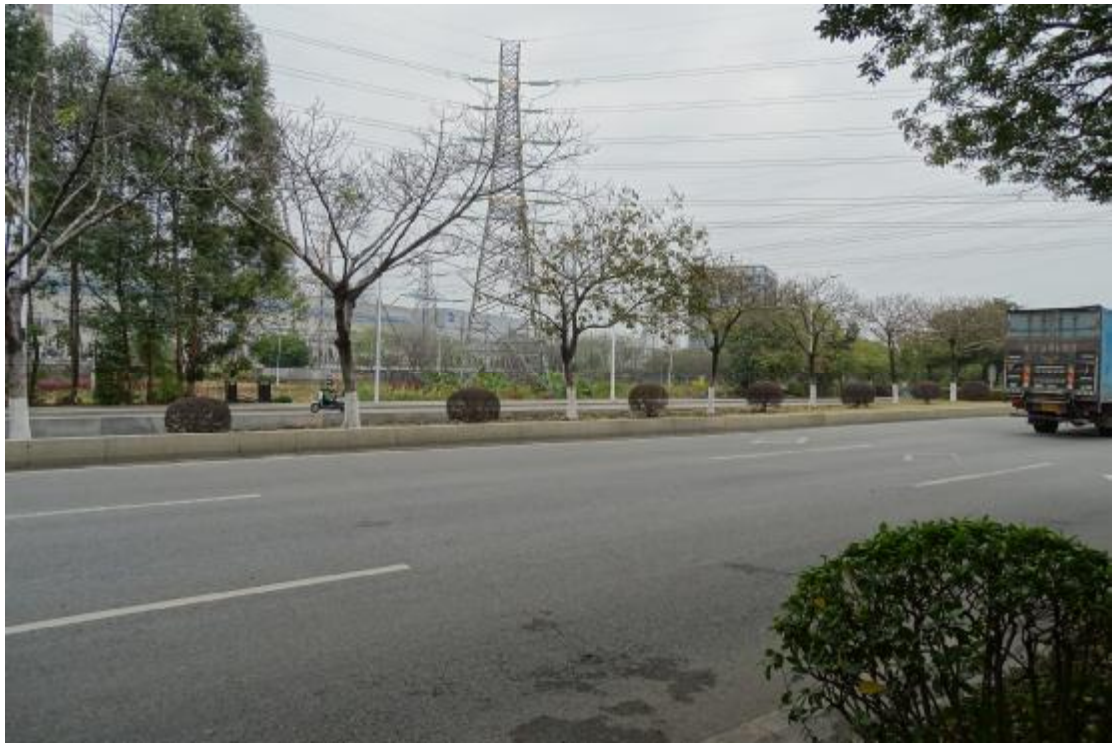
图 23 地表现状（西-东）