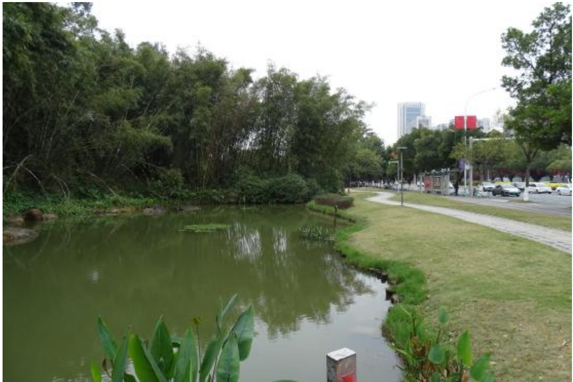
图 17 地表现状（东-西）