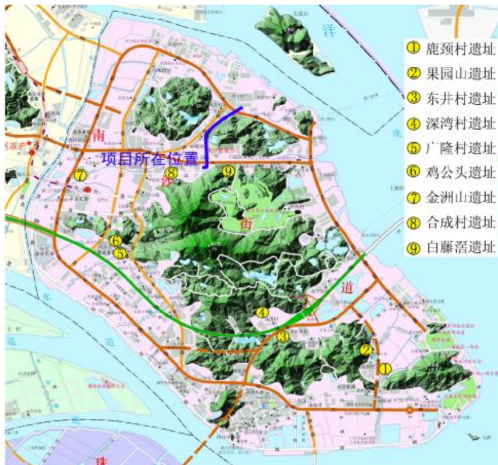
图 4 地块在南沙街道位置示意图

辟为梯田式的荔枝林。地面采集到饰有细方格纹和夔纹的泥质红陶片，以及夹砂灰陶和红陶片等。可辨器形有夹砂红陶盆。遗址时代约在西周至春秋阶段。同时，地面还散落有许多素面的唐代黑釉瓷片和青瓷片，其分布范围东西约 100 米，南北约 50 米，瓷片中可辨的器形有罐、小口双耳瓮，表明唐时这里亦有人居。