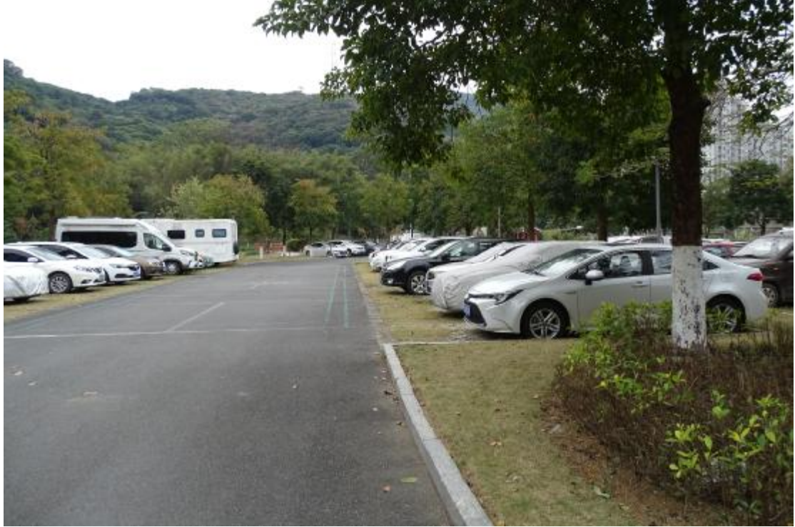
图 16 地表现状（北-南）