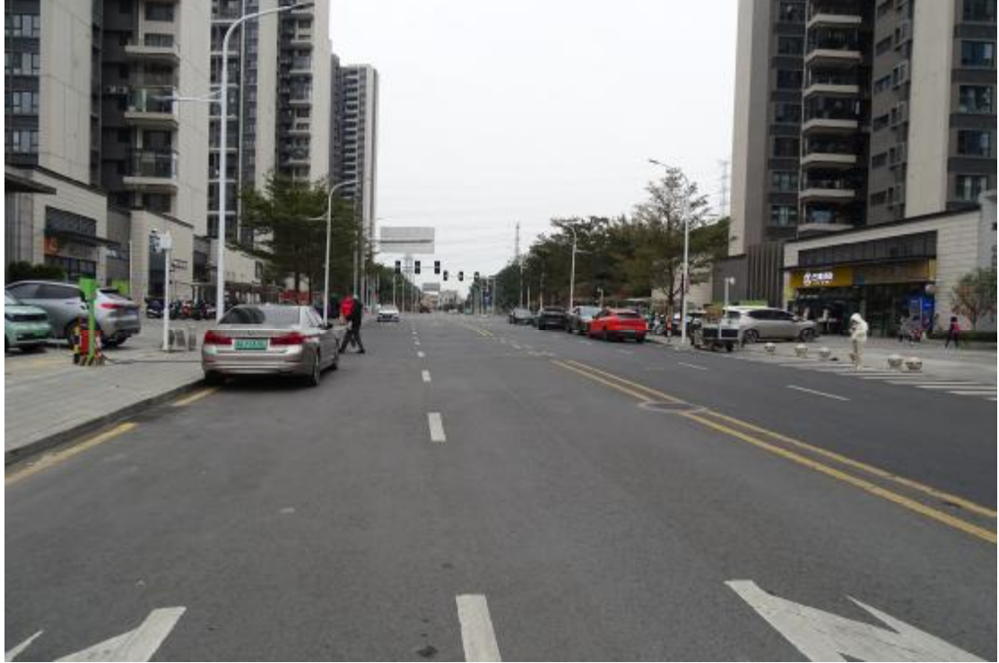
图 20 地表现状（南-北）