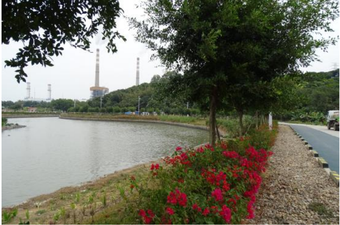
图 22 地表现状（西-东）