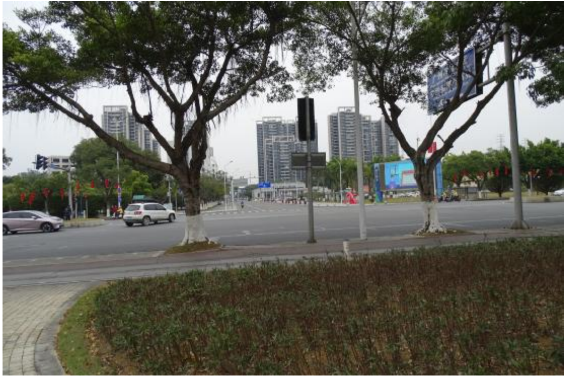
图 18 地表现状（南-北）