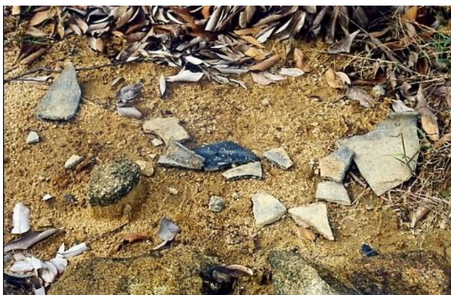
图 5 白藤濠遗址地表先秦及唐代陶片