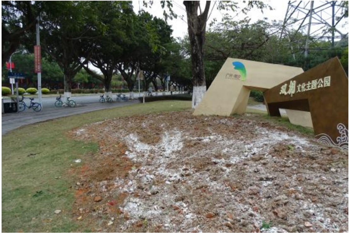
图 10 地表现状（西-东）