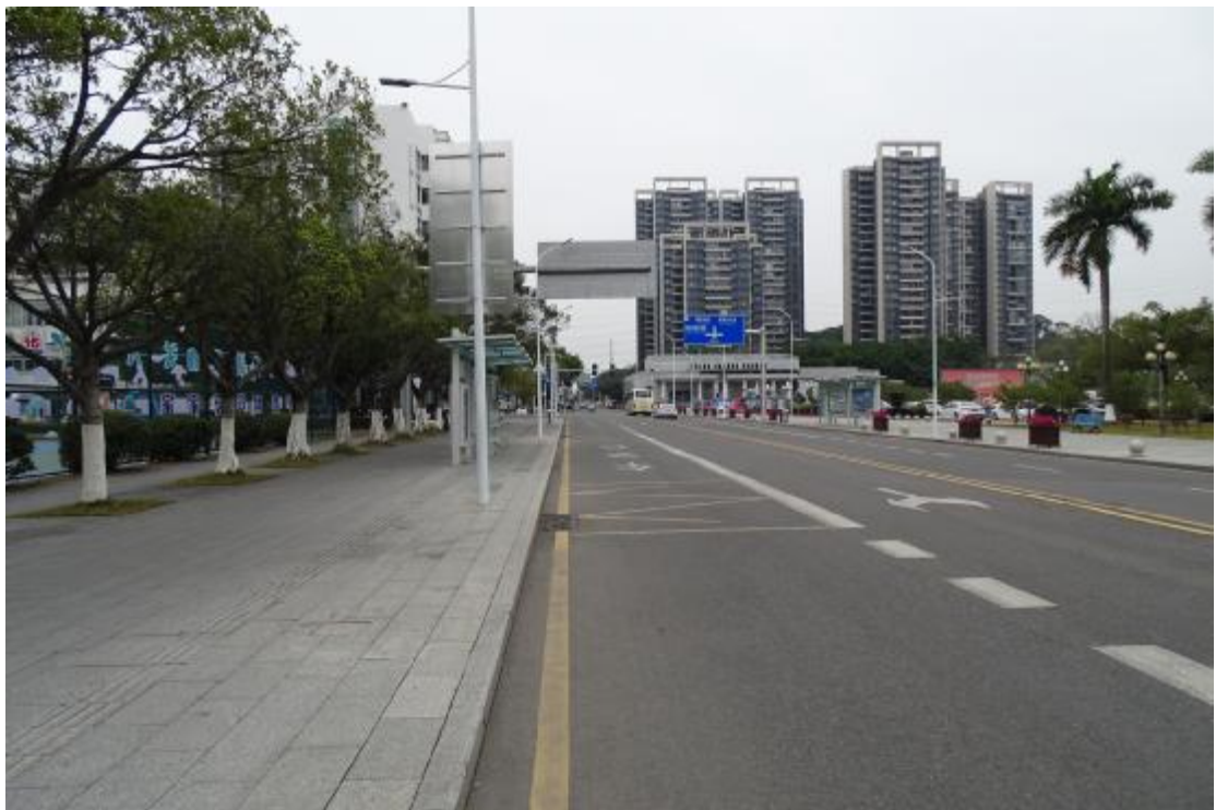
图 19 地表现状（南-北）