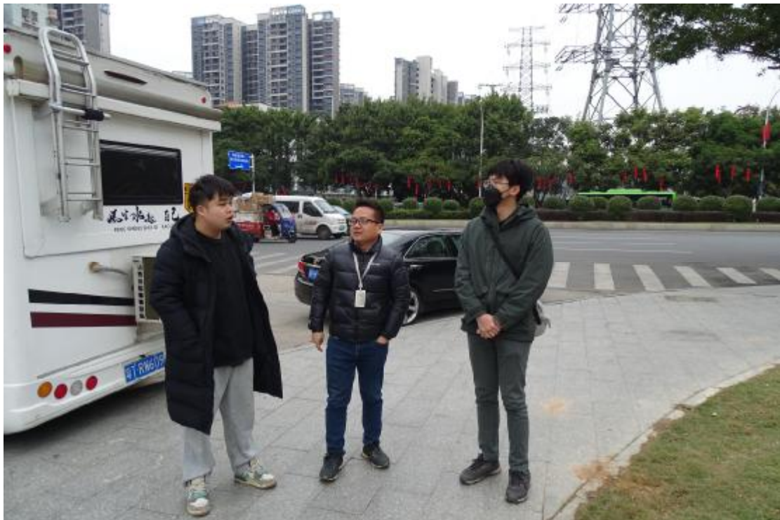
图 7 与现场工作人员确定地块范围（南-北）