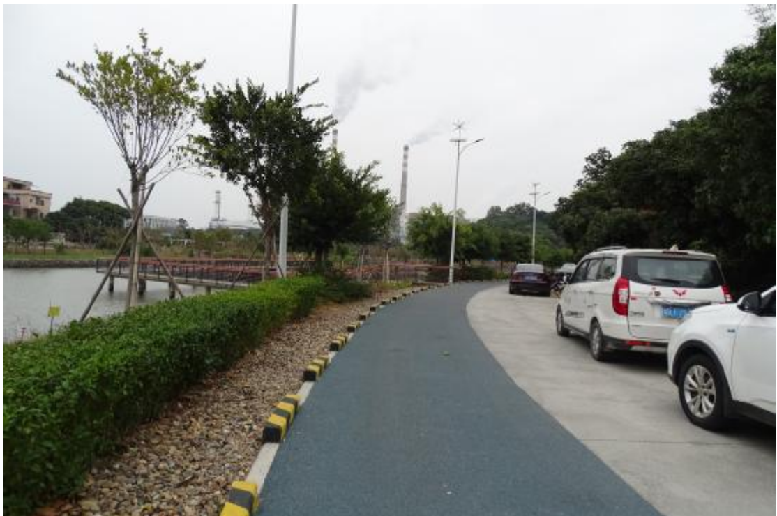
图 21 地表现状（西-东）