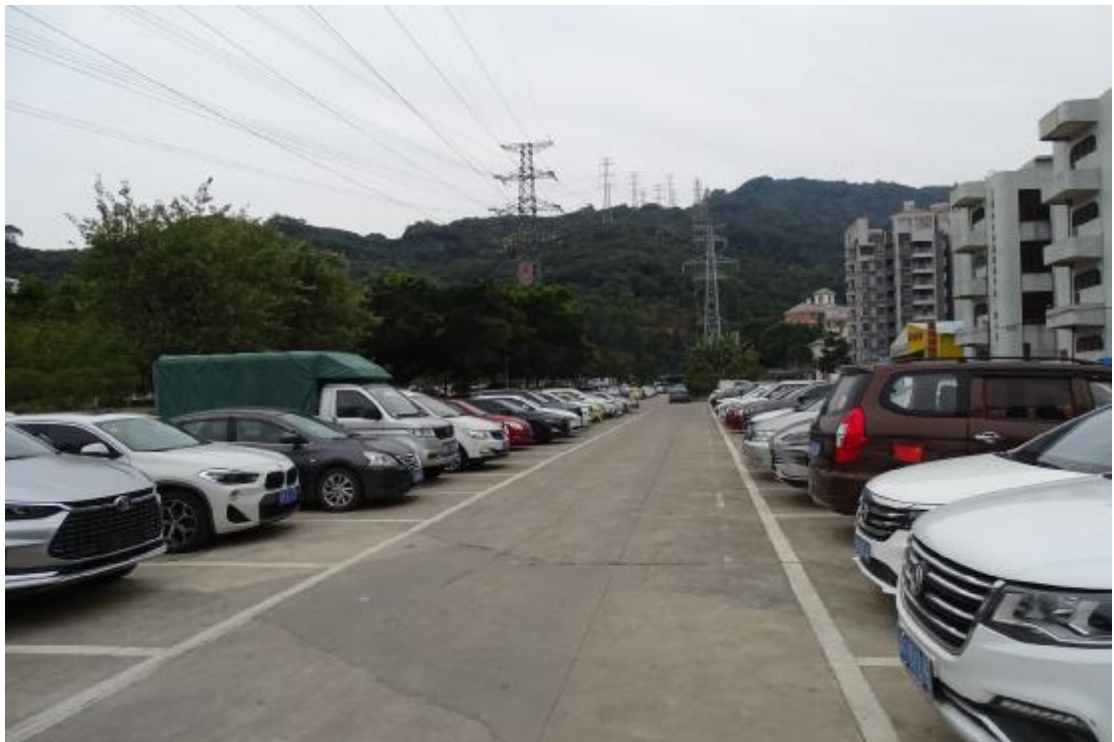
图 9 地表现状（北-南）