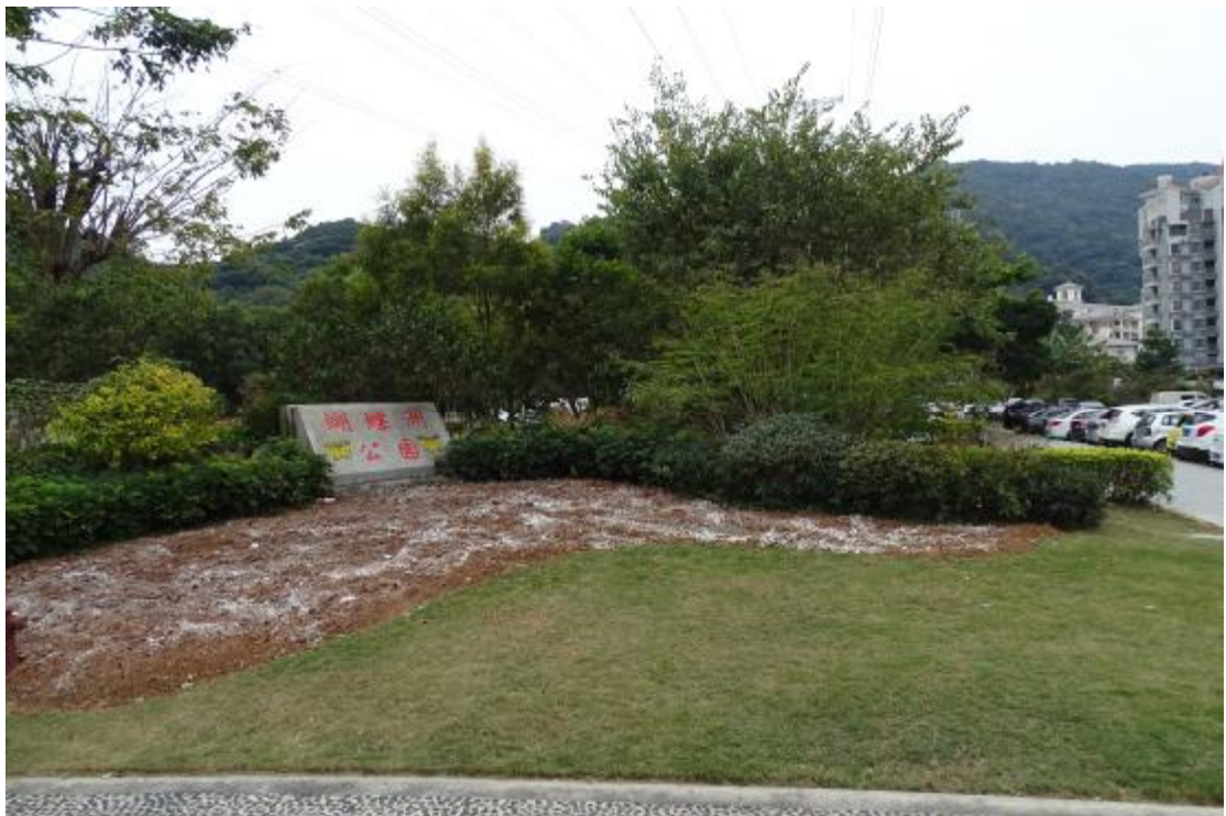
图 13 地表现状（北-南）