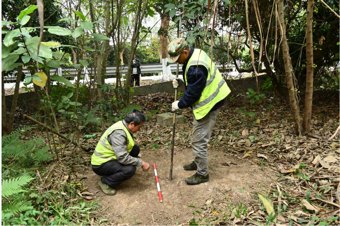
图 37 土样提取（西南-东北）