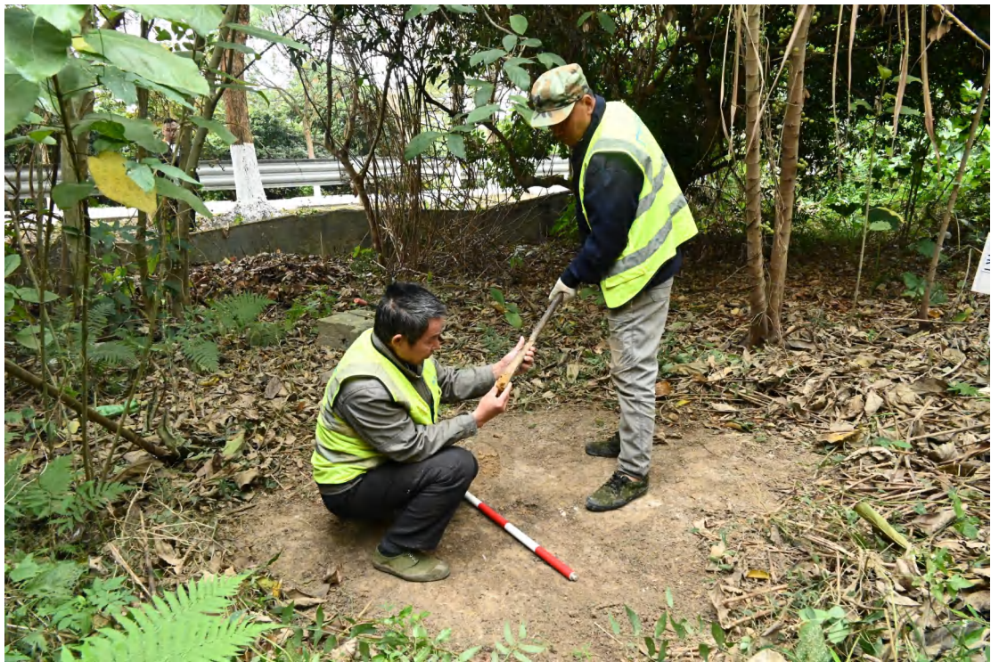
图 38 土样分析（西南-东北）