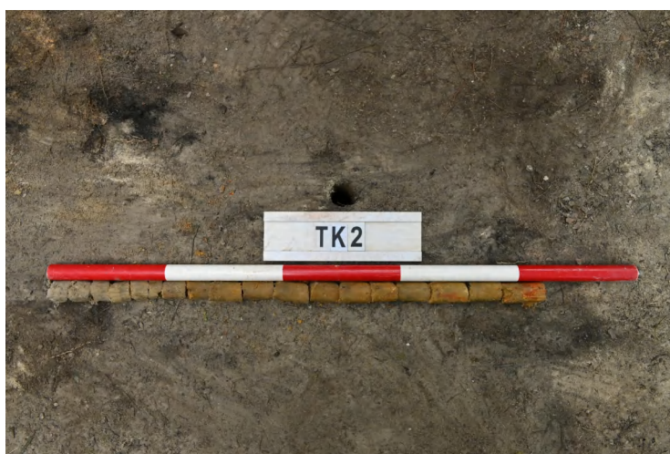
图 40 TK2 土样（一米标杆，土样由左往右）

②层：垫土层，距地表深 0.22-0.65 米，厚 0.43 米，为灰黄色黏土，土质较疏松，内含植物根系、砂砾。以下为红黄色风化土，土质致密、纯净，系生土。