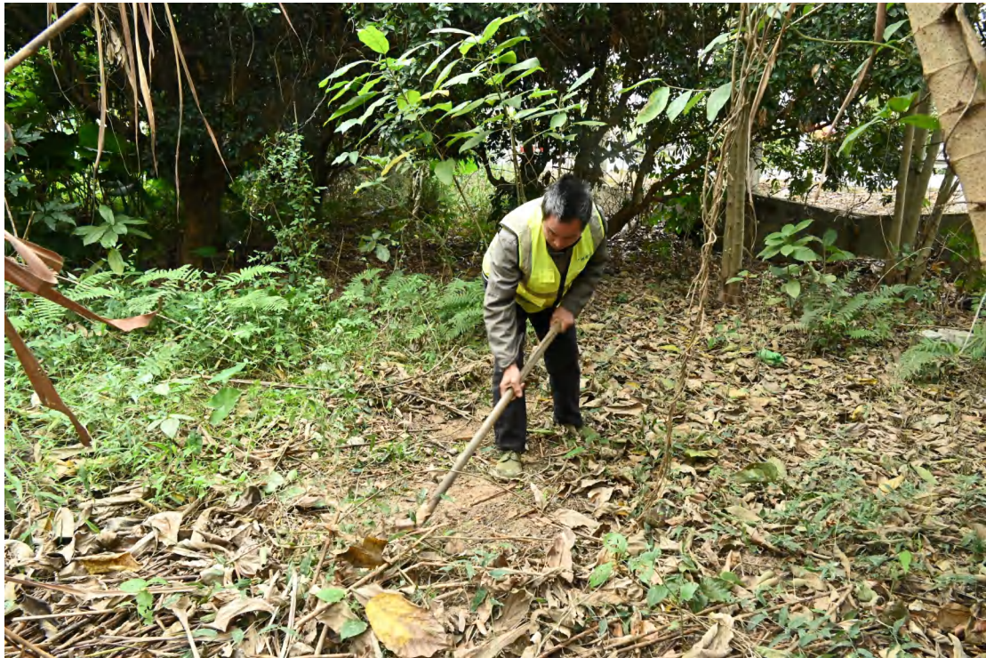
图 36 地表清理（东南-西北）