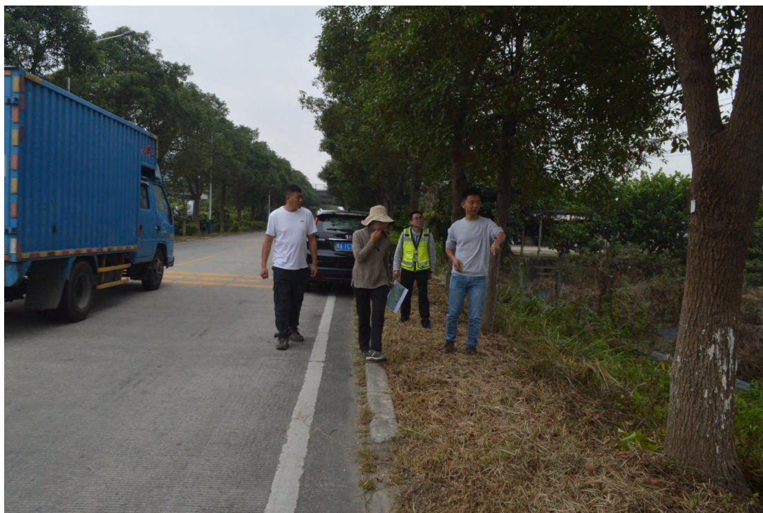
图 11 现场踏查（西-东）