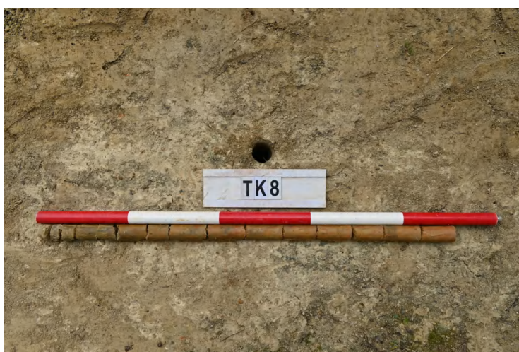
图 46 TK8 土样（一米标杆，土样由左往右）

②层：垫土层，距地表深 0.18-0.78 米，厚 0.7 米，为灰黄色黏土，土质较疏松，内含植物根系、砂砾。以下为红黄色风化土，土质致密、纯净，系生土。