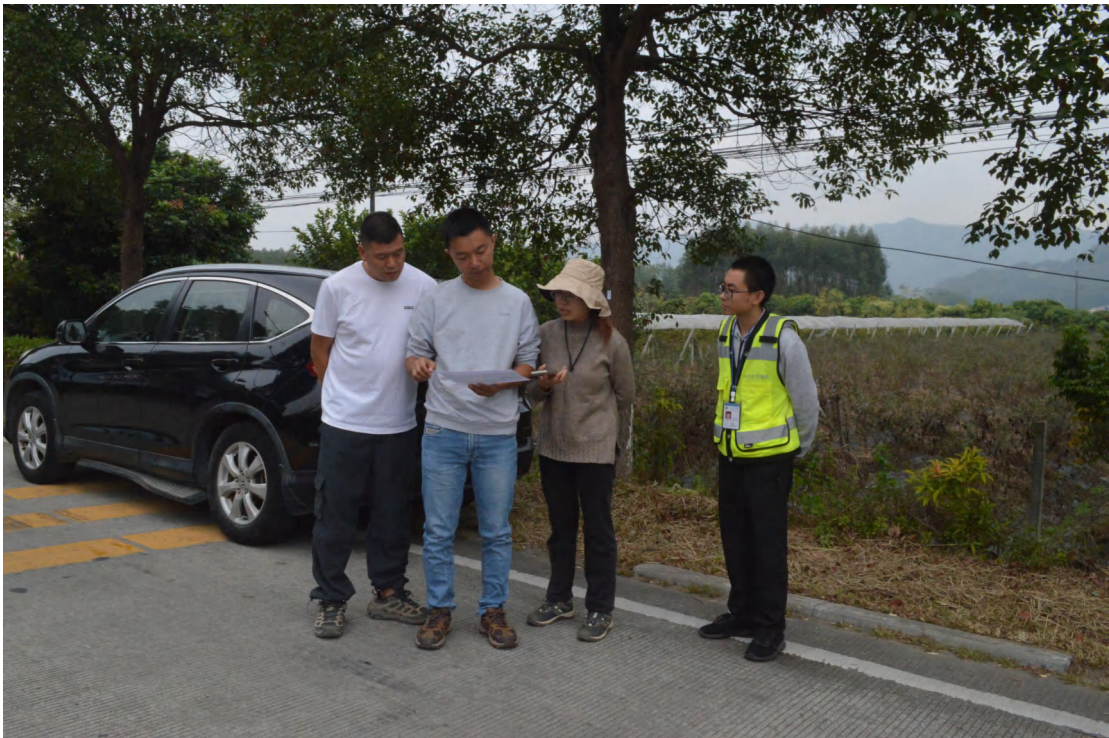
图 10 工作人员确认地块范围（西北-东南）