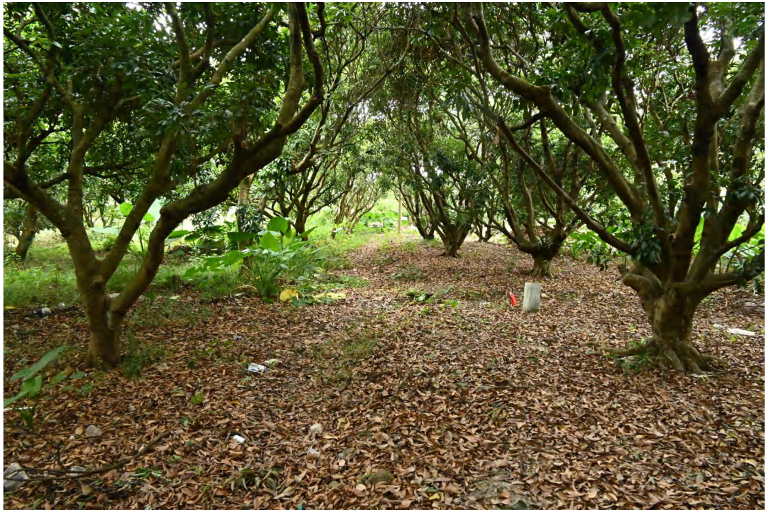
图 30 地块内现状（北-南）