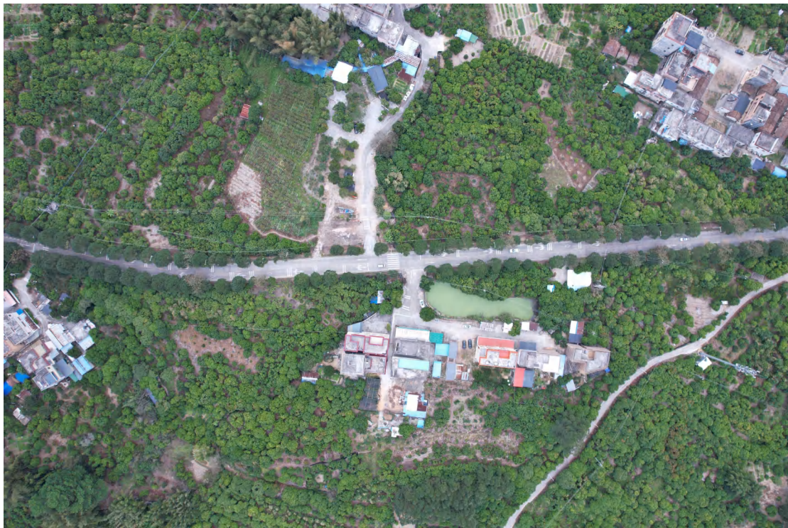
图 18 地块内中部现状（上南-下北）