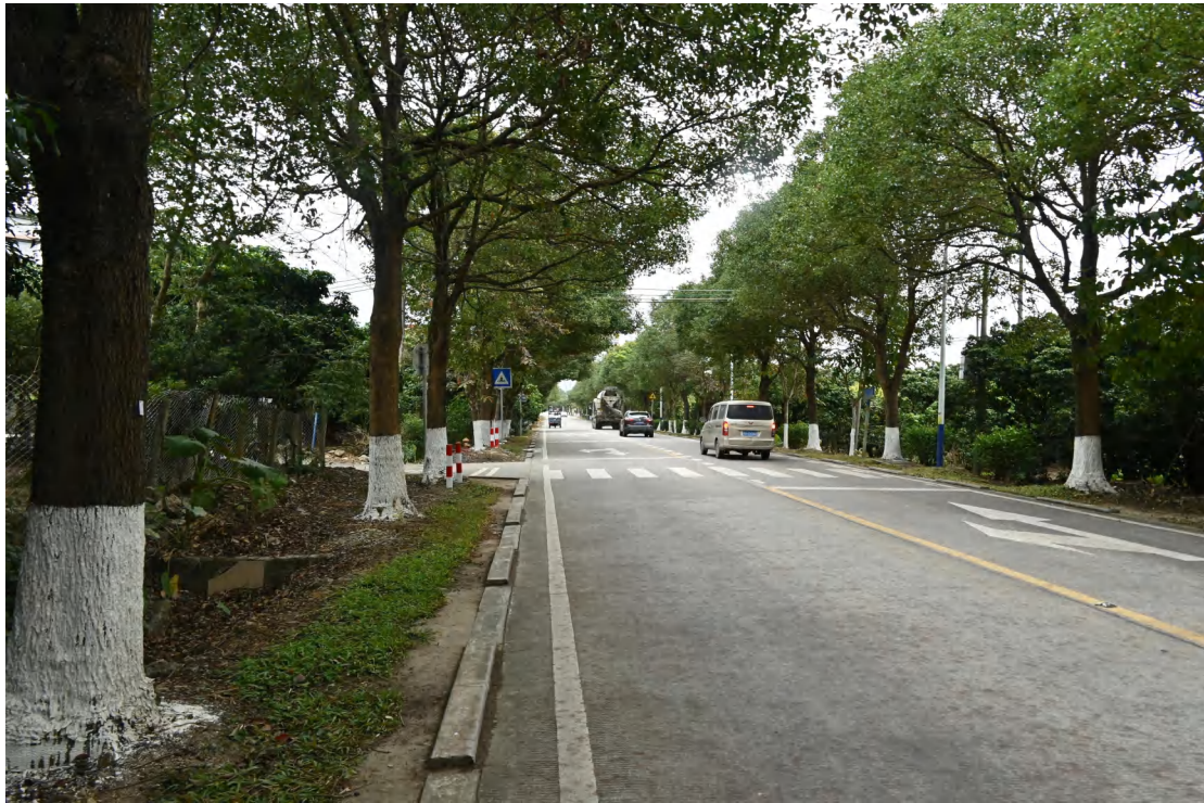
图 26 地块内现状（东-西）