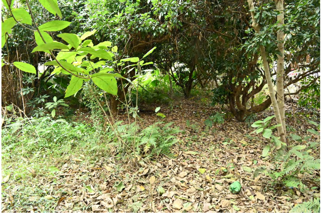
图 31 地块内现状（北-南）