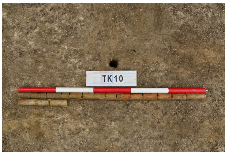
图 48 TK10 土样（一米标杆，土样由左上往右下）

②层：垫土层，距地表深 0.22-0.42 米，厚 0.2 米，为灰黄色黏土，土质较疏松，内含植物根系、砂砾。以下为红黄色风化土，土质致密、纯净，系生土。