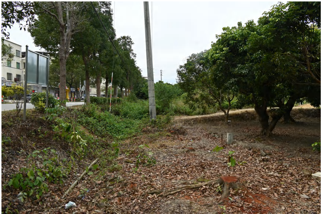
图 34 地块内现状（西-东）