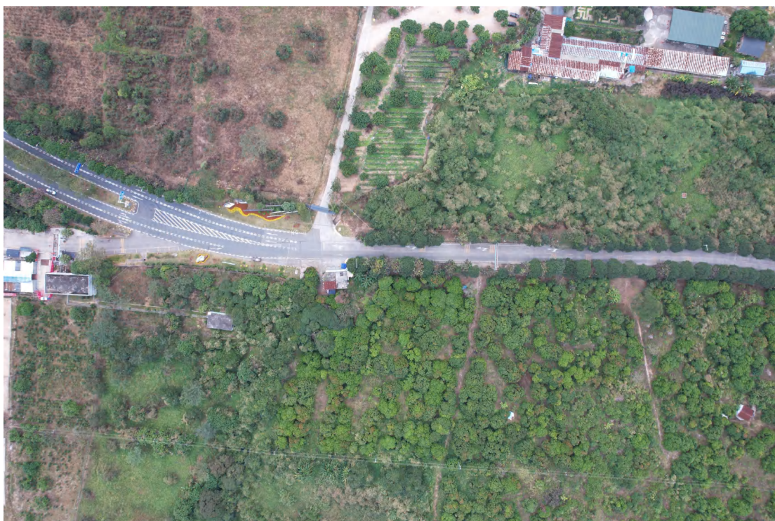
图 12 地块内东部现状（上南-下北）