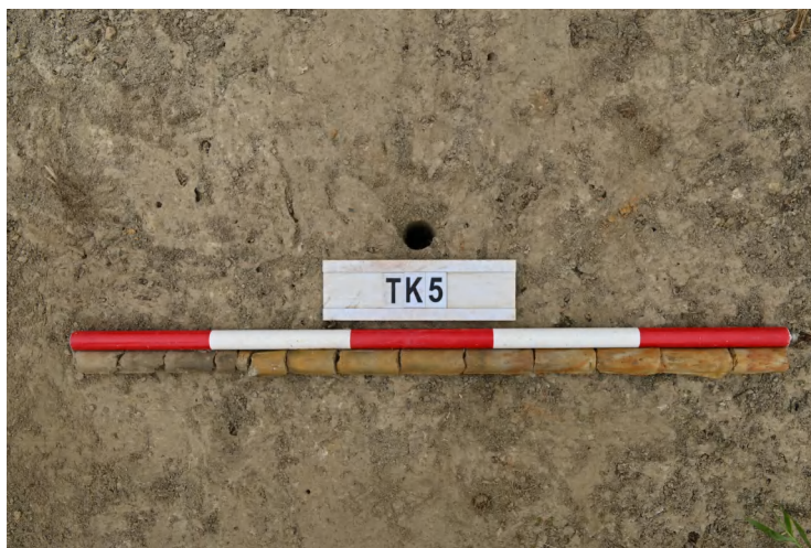
图 43 TK5 土样（一米标杆，土样由左往右）

②层：垫土层，距地表深 0.25-0.60 米，厚 0.60 米，为灰黄色黏土，土质较疏松，内含植物根系、砂砾。以下为红黄色风化土，土质致密、纯净，系生土。