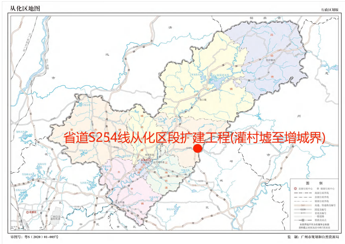
图 2 项目地块在从化区位置示意图（广州市规划和自然资源局）