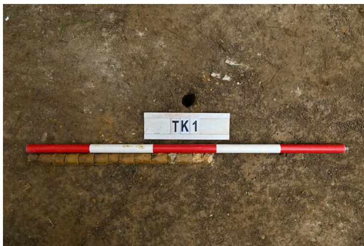
图 39 TK1 土样（一米标杆，土样由左往右）

②层：垫土层，距地表深 0.12-0.52 米，厚 0.4 米，为灰黄色黏土，土质较疏松，内含植物根系、石块。以下为红黄色风化土，土质致密、纯净，系生土。