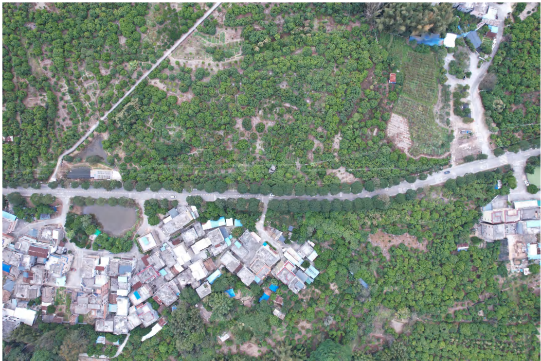
图 16 地块内中东部现状（上南-下北）