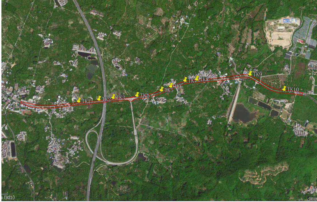
图 35 试探标准孔位置分布图（黄色标记点）

为进一步了解并掌握该地块内地层堆积情况，我们在地块范围内进行了试探。选取 10 个标准型探孔，编号为 TK1-TK10，具体情况如下：