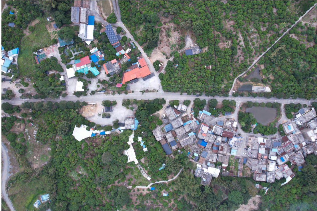
图 17 地块内中东部现状（上南-下北）