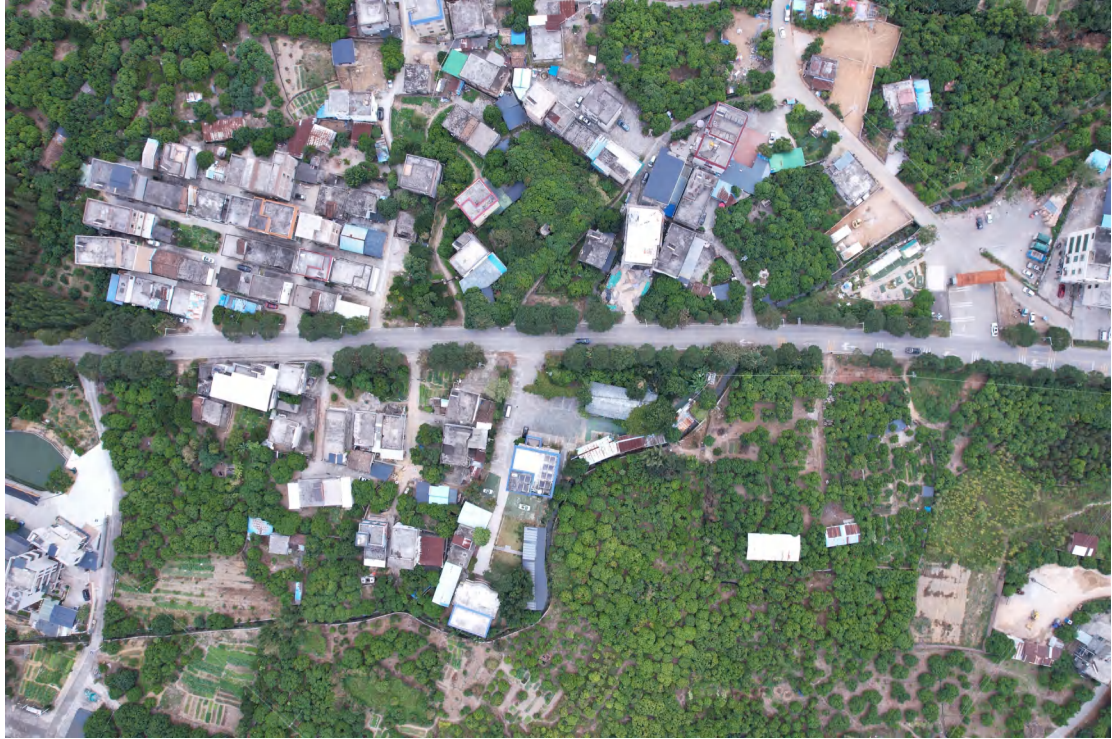
图 23 地块内西部现状（上南-下北）