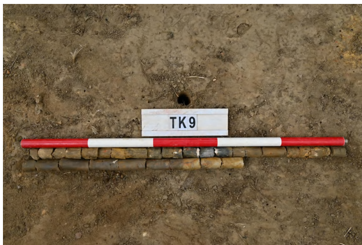
图 47 TK9 土样（一米标杆，土样由左上往右下）

②层：垫土层，距地表深 0.5-1.50 米，厚 1.0 米，为灰黑色黏土，土质较疏松，内含植物根系、砂砾。以下为红黄色风化土，土质致密、纯净，系生土。