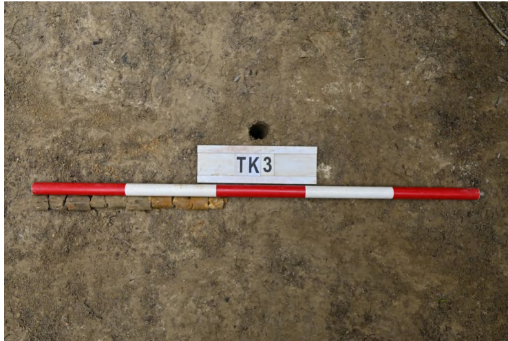
图 41 TK3 土样（一米标杆，土样由左往右）

②层：垫土层，距地表深 0.25-0.38 米，厚 0.13 米，为灰红色黏土，土质较疏松，内含植物根系、砂砾。以下为红黄色风化土，土质致密、纯净，系生土。