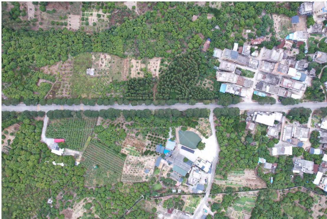
图 22 地块内西部现状（上南-下北）