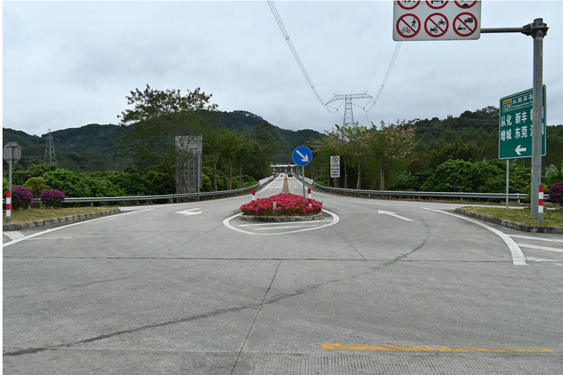
图 25 地块内现状（北-南）