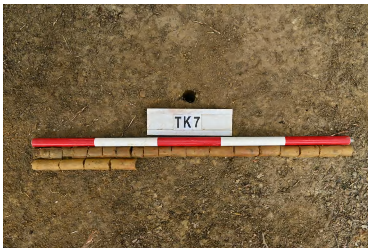
图 45 TK7 土样（一米标杆，土样由左上往右下）

②层：垫土层，距地表深 0.12-0.75 米，厚 0.63 米，为灰黄色黏土，土质较疏松，内含植物根系、砂砾。以下为红黄色风化土，土质致密、纯净，系生土。