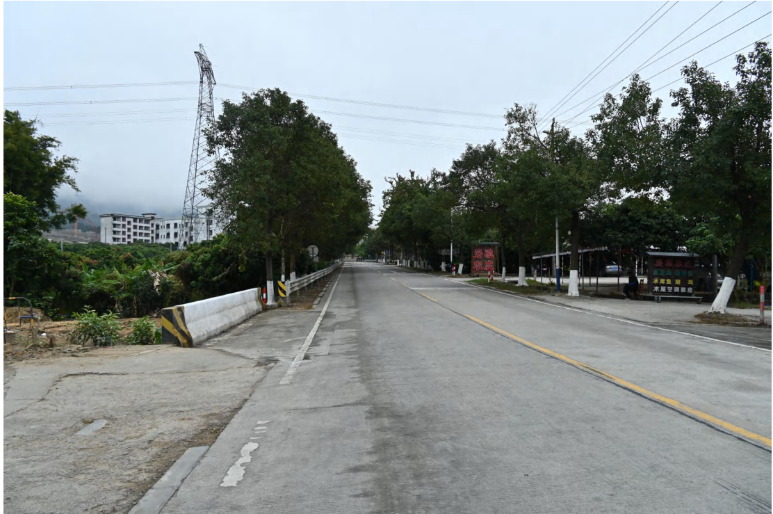
图 27 地块内现状（东-西）