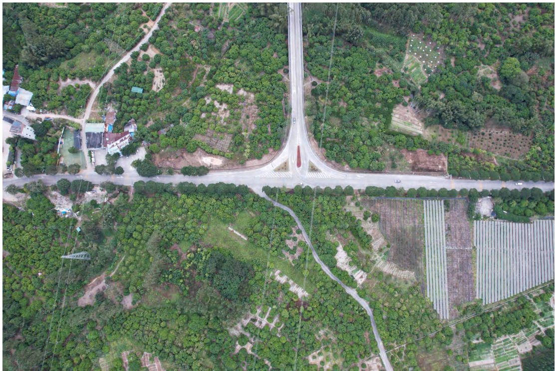
图 20 地块内中部现状（上南-下北）