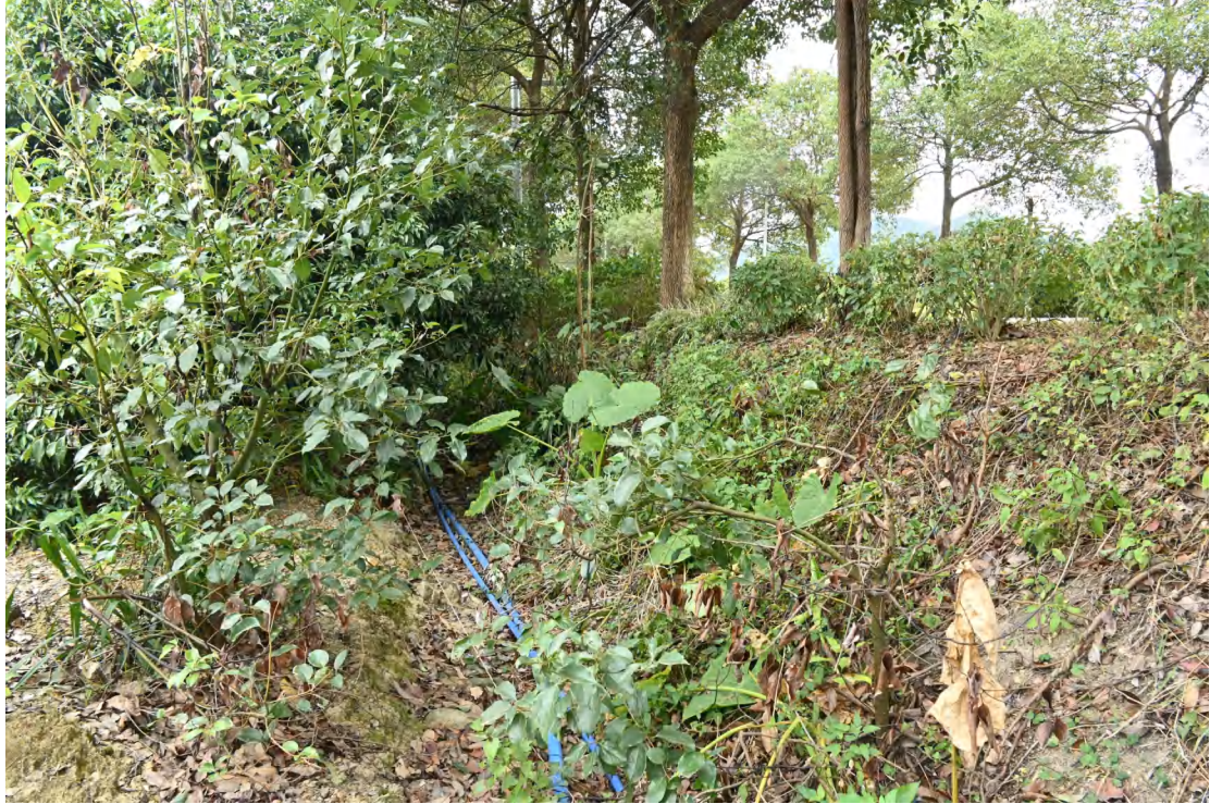
图 33 地块内现状（西-东）