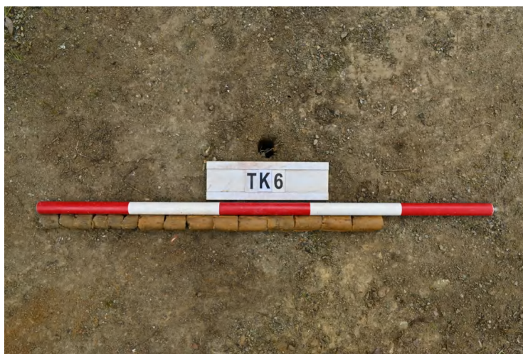
图 44 TK6 土样（一米标杆，土样由左往右）

②层：垫土层，距地表深 0.05-0.22 米，厚 0.17 米，为灰黄色黏土，土质较疏松，内含植物根系、砂砾。以下为红黄色风化土，土质致密、纯净，系生土。