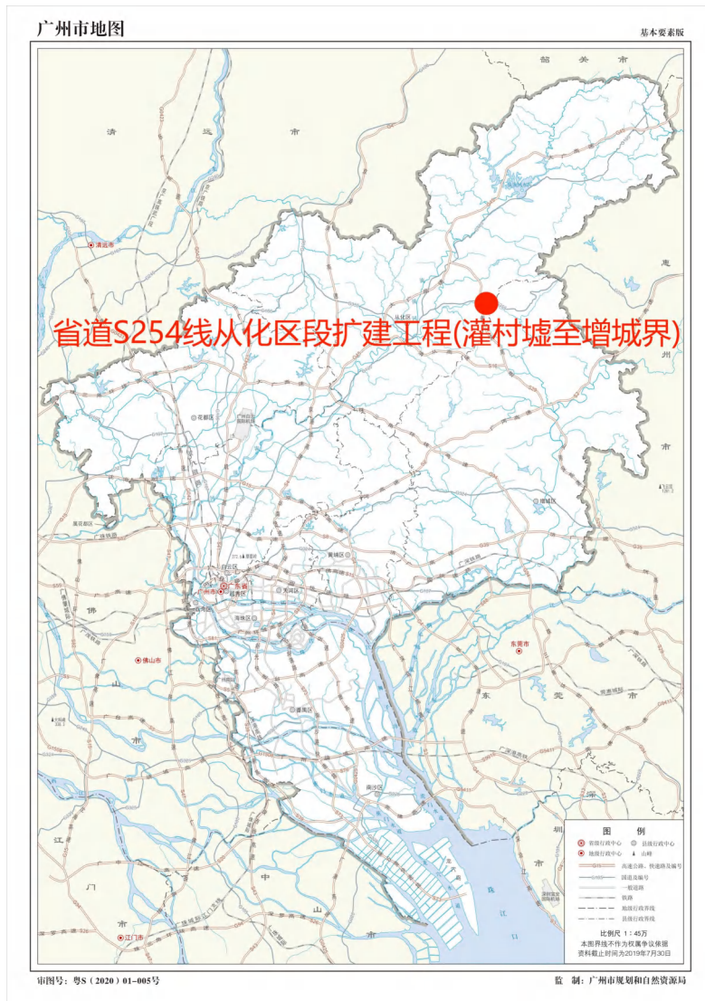
图 1 项目地块在广州市位置示意图(广州市规划和自然资源局)

根据《中华人民共和国文物保护法》《广州市文物保护规定》,按照《广州市文物局关于省道 S254 线从化区段扩建工程(灌村墟至增城界)考古调查勘探工作的复函》(文物 20231264 号)指导意见,受广州市从化区公路管养中心委托,由我院负责该项目的考古调查工作。