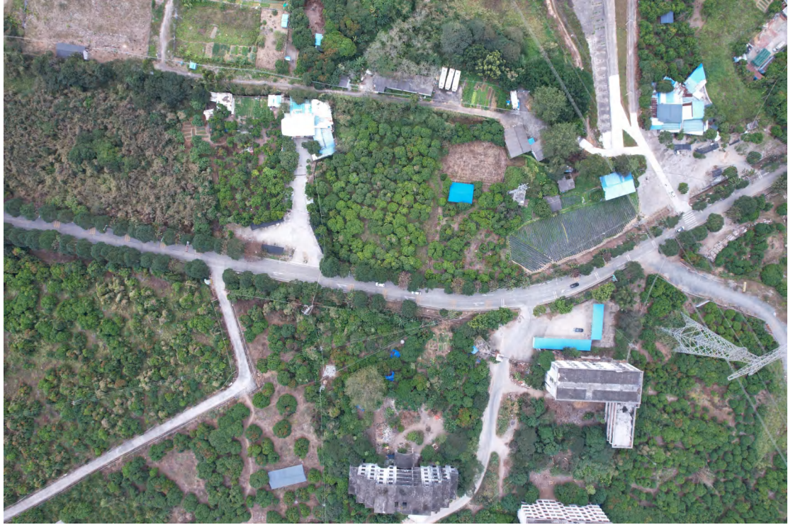
图 13 地块内东部现状（上南-下北）