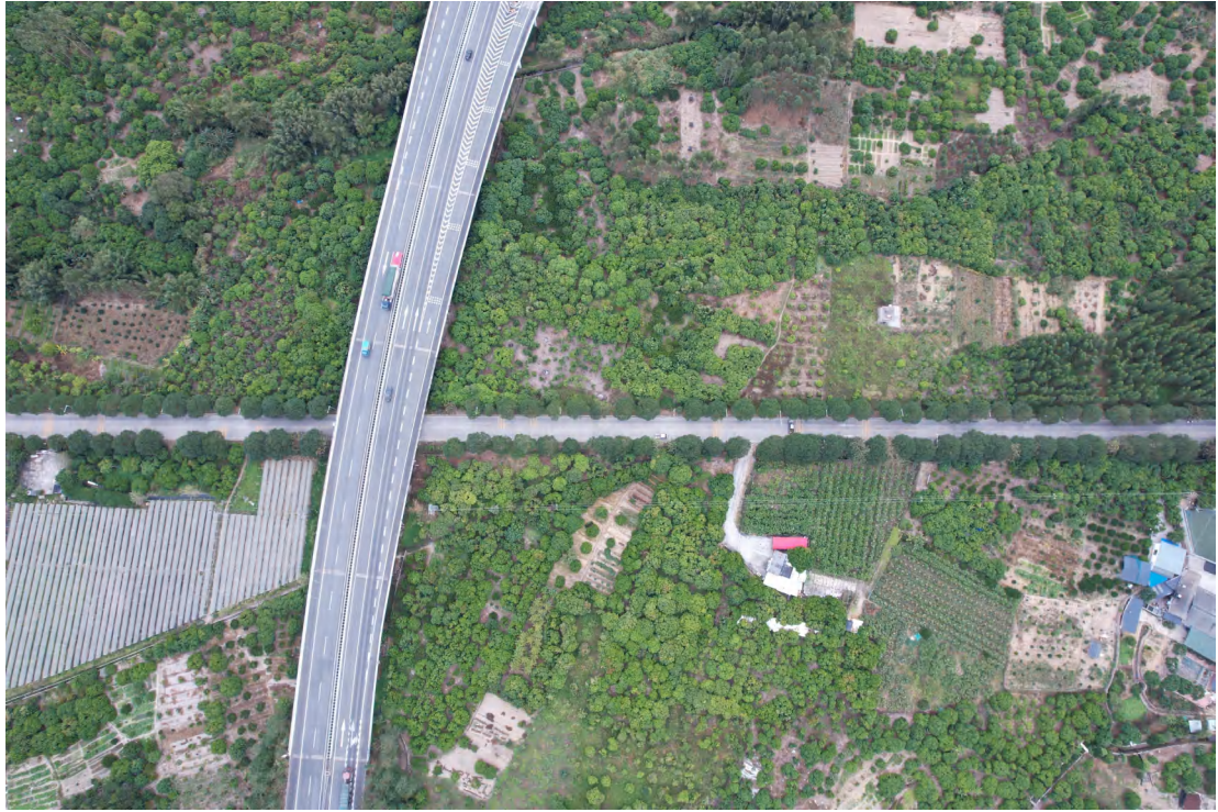
图 21 地块内中西部现状（上南-下北）