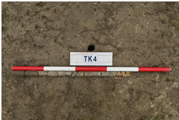
图 42 TK4 土样（一米标杆，土样由左往右）

②层：垫土层，距地表深 0.16-0.65 米，厚 0.49 米，为灰黄色黏土，土质较疏松，内含植物根系、砂砾。以下为红黄色风化土，土质致密、纯净，系生土。