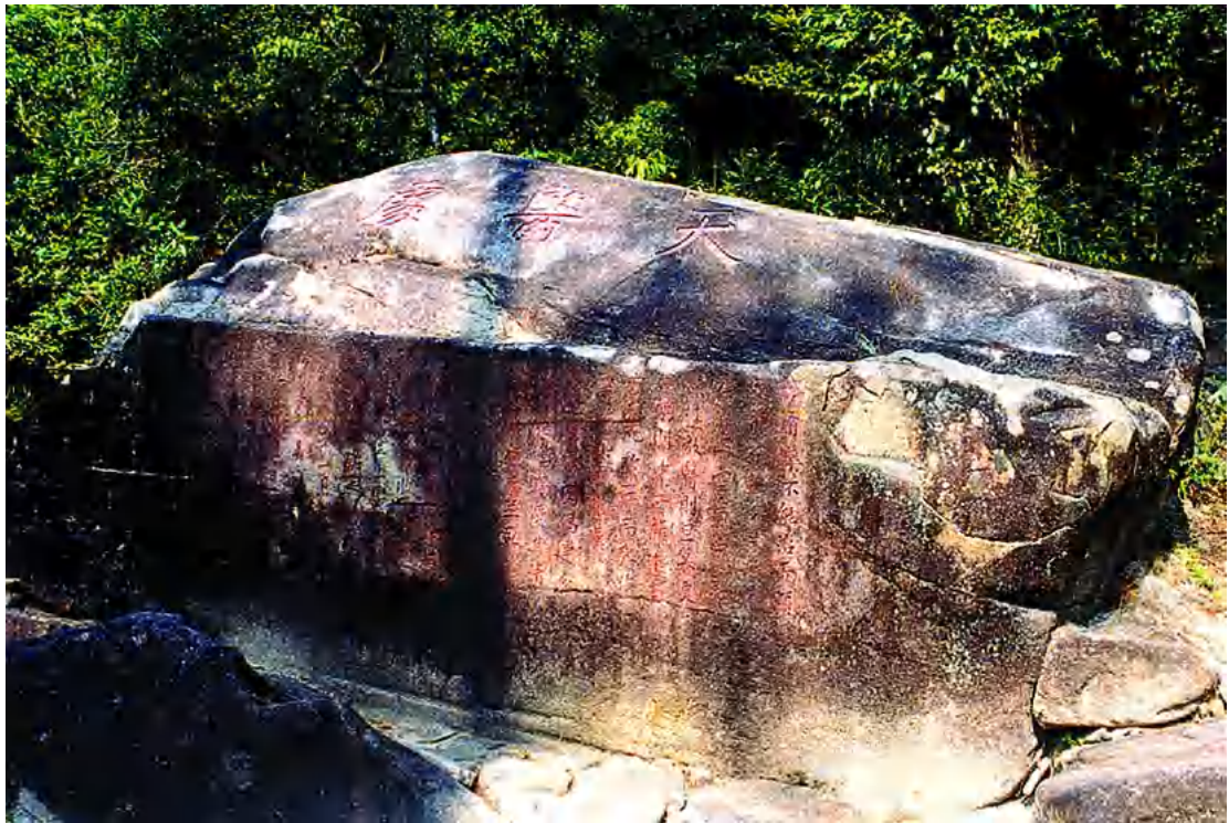
图 7 “天医处”摩崖石刻

“天医处”铭文为：病有药不能治，而需天医者，世多昧此。日居污浊空气中，病欲速效，医则旦暮更张，药则中西杂进，至有不死于病，而死于药者，良可慨叹。珠江颐养园倡建分园于此间，岂独爱其清幽，宜于颐养，并取其环境适于治疗。凡属来居，谅同此见。而仍刻以相告者，异日触目，俾有恒心，以收王道之功，而登上寿之域，亦古人座右铭之意也。民国 26 年 1 月，分园第一院落成之日，顺德梁培基题，亦行之证。现为广州市文物保护单位。