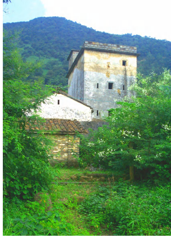
图 9 茶园楼署