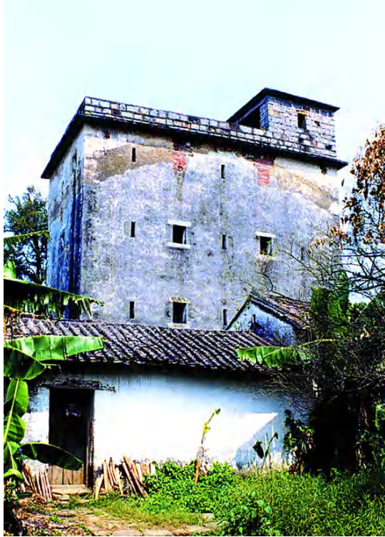
图 8 茶园楼署

第三层楼面为木板铺作。楼体深 10 米，宽 5.16 米。现为从化区登记文物保护单位。