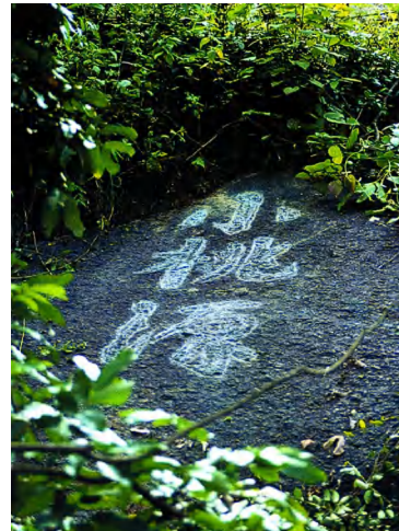
图 6 “小桃源”摩崖石刻

“天医处”摩崖石刻 刻在温泉镇广东温泉宾馆后山一石头上。沿松园小溪逆流上溯，过苍苍莽莽的山林，踏曲折石径，径于水源尽处折环而回，是进行“天医”的好地方，“天医处”便刻于此处大石上，为行体，下有竖刻铭文数行，阐述进行“天医”之原委。天医，即在清幽秀美的山水间保健颐养。