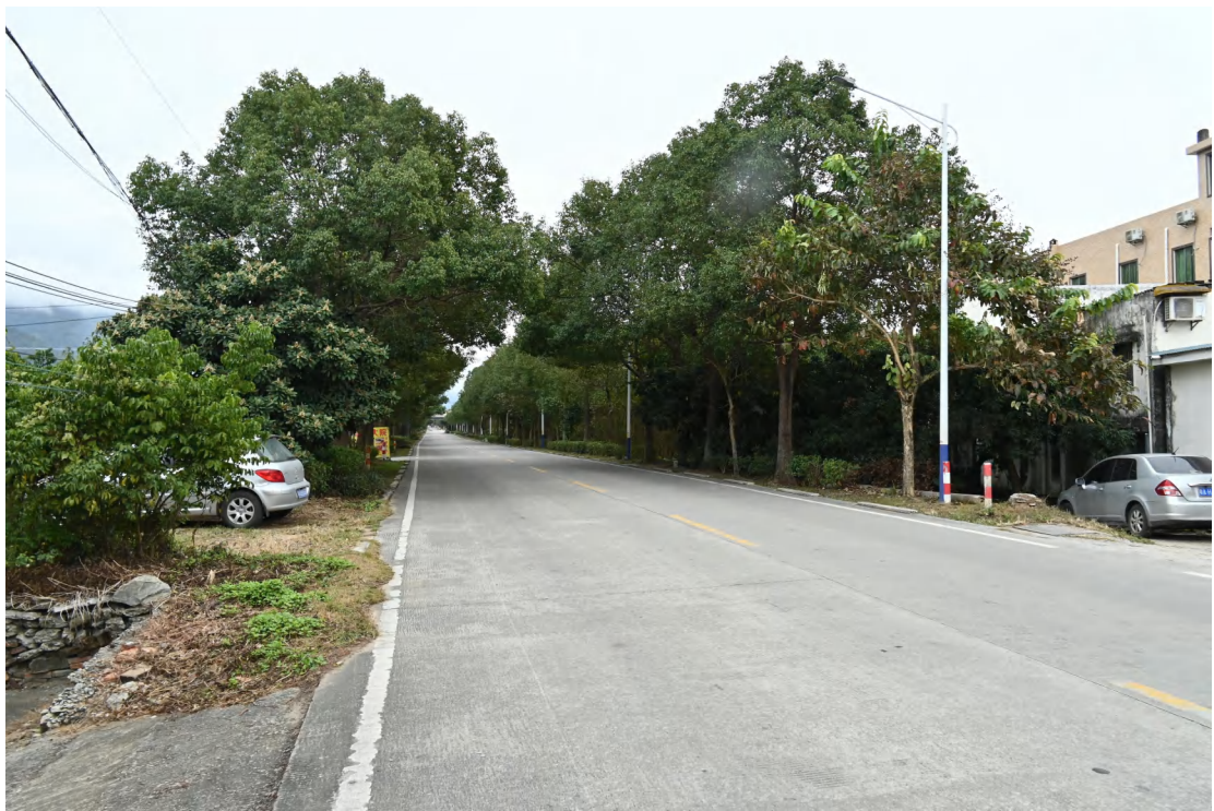
图 28 地块内现状（西-东）