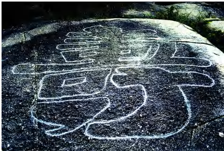
图 5 “寿”摩崖石刻

“寿”字刻在一大石质山体上，其石表面平整，微向下倾，为隶书，字体高 3 米，宽 2.8 米，右下则落款为行体“韶山子书”。“小桃源”题字在“寿”字下 20 米处，丹井之上，字体为行书。“中心山”题字又刻于“小桃源”下，无落款。现为广州市文物保护单位。