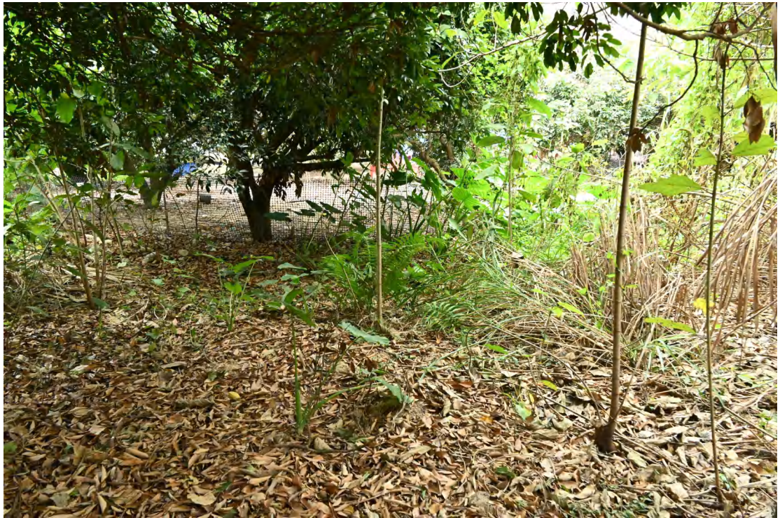
图 32 地块内现状（北-南）