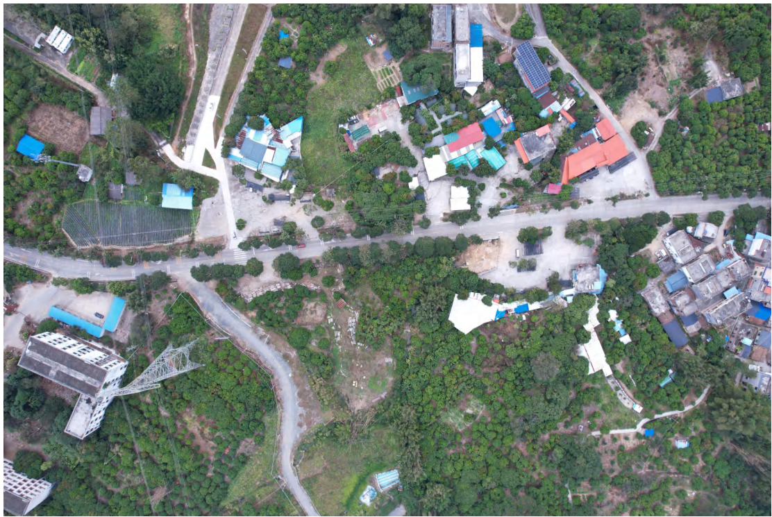
图 14 地块内东部现状（上南-下北）