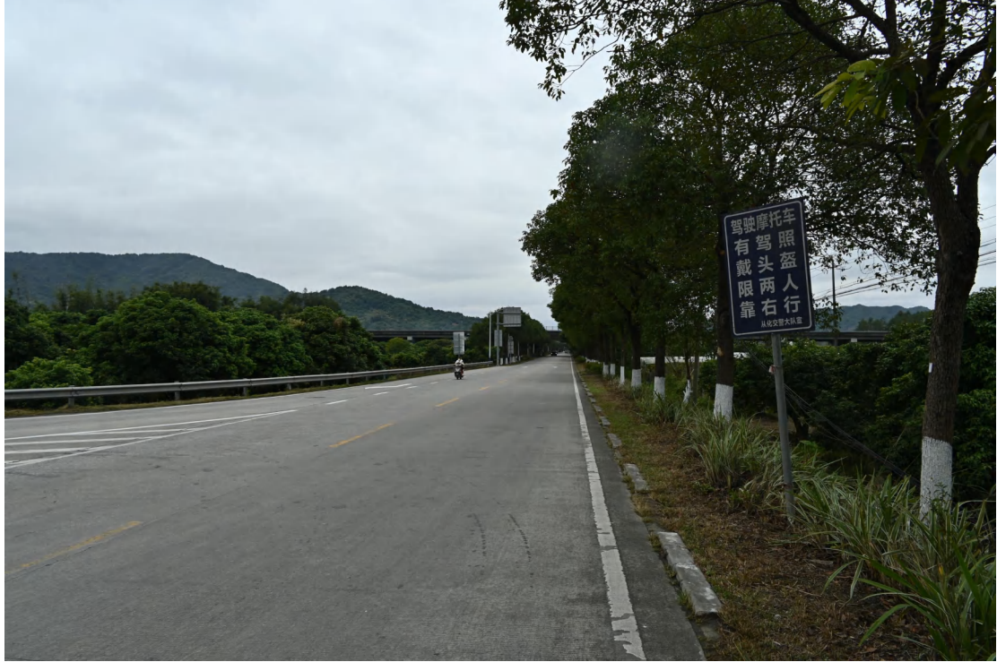
图 29 地块内现状（西-东）