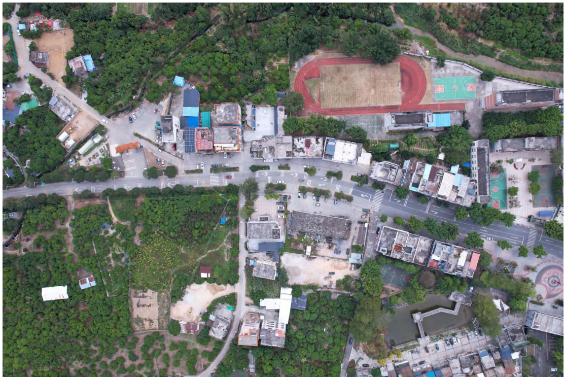
图 24 地块内西部现状（上南-下北）