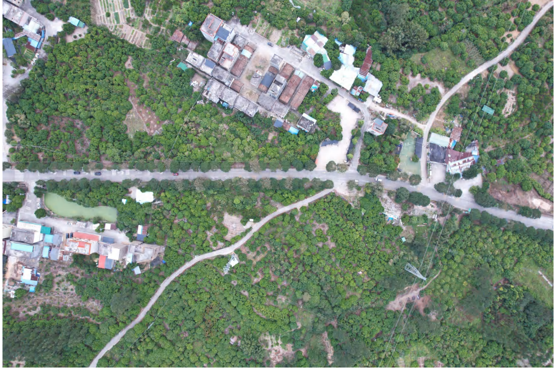
图 19 地块内中部现状（上南-下北）