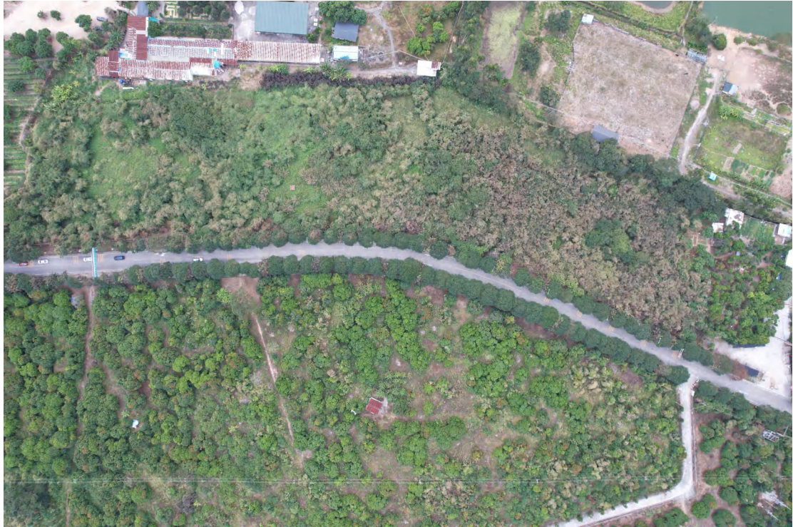
图 15 地块内东部现状（上南-下北）