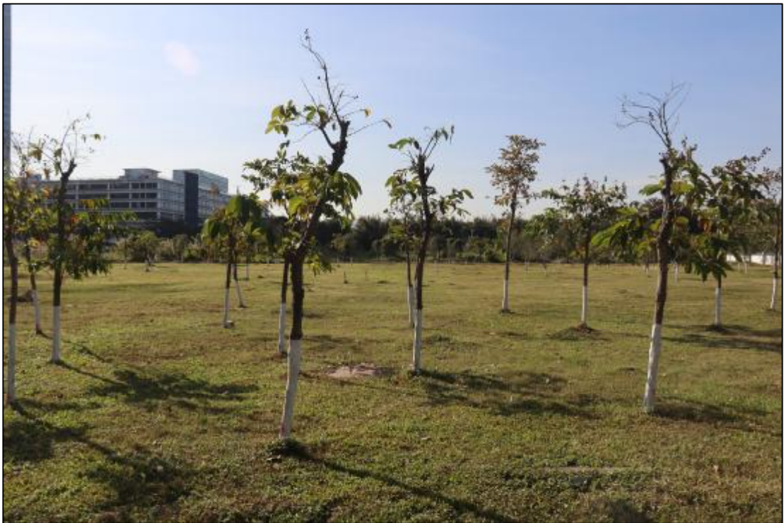
图 19 17 (AH0915017) 地块中部现状 (东-西)