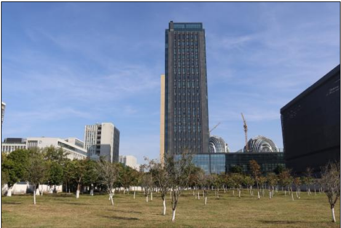
图 17 17 (AH0915017) 地块东部现状 (西-东)