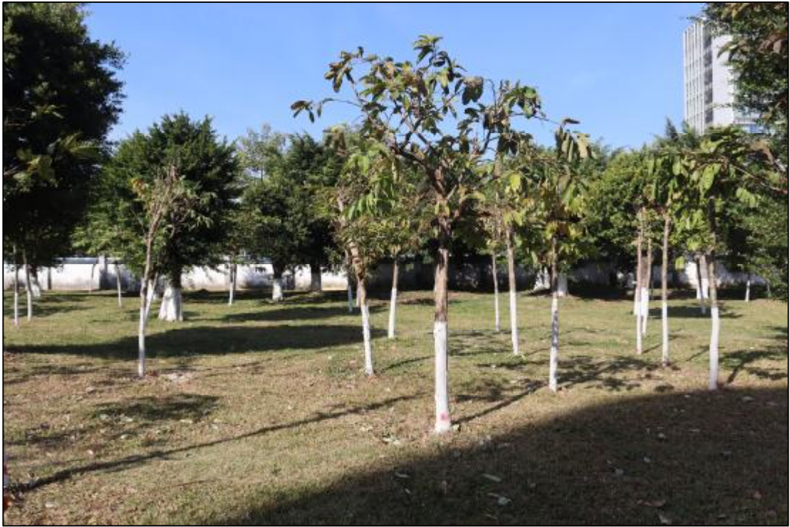
图 16 17 (AH0915017) 地块东部现状 (南-北)