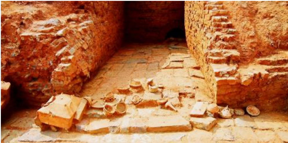
图 9 官洲岛花果山东汉墓 M1