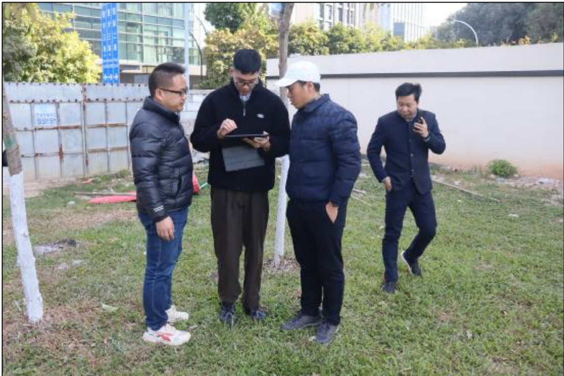
图 11 工作人员现场了解项目情况（东-西）