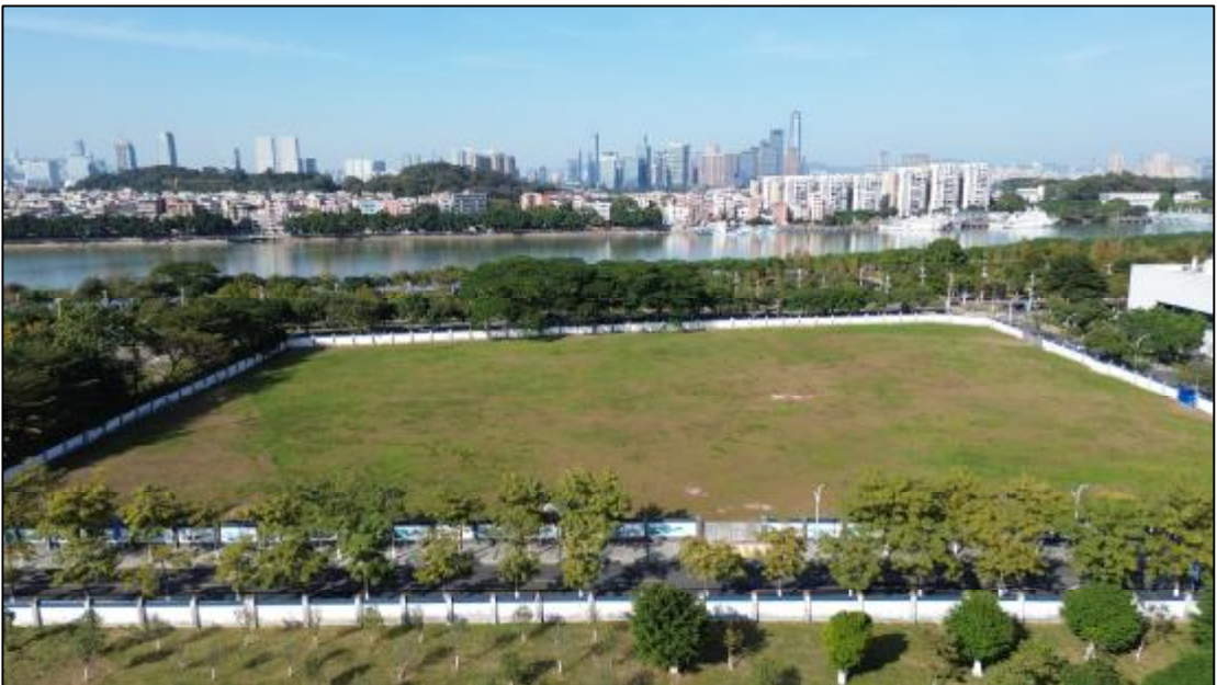
图 13 16（AH0915015）地块现状（南-北）