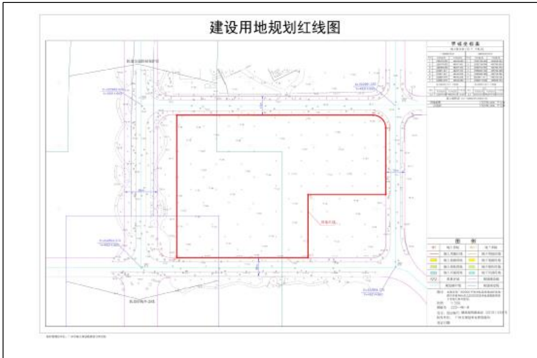
图 5 17 (AH0915017) 地块红线图 (甲方提供)