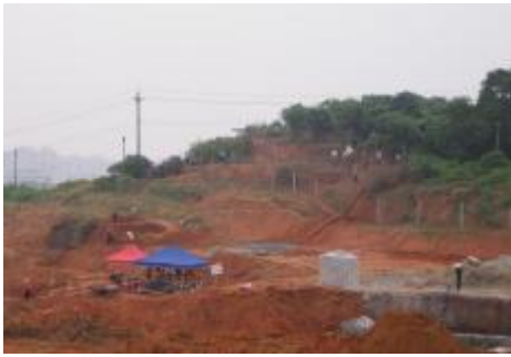
图 7 官洲岛考古发掘现场