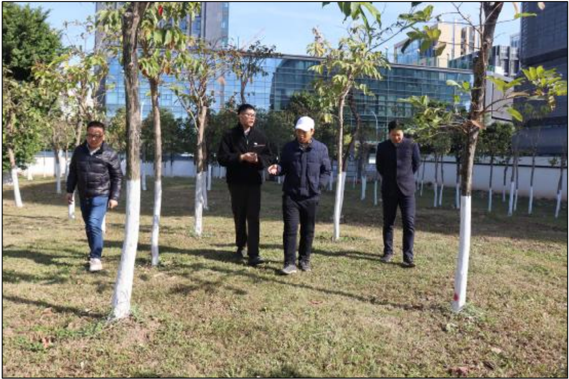
图 12 踏查工作照（东-西）