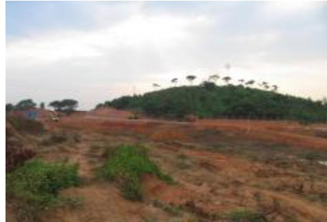
图 8 官洲岛考古勘探现场