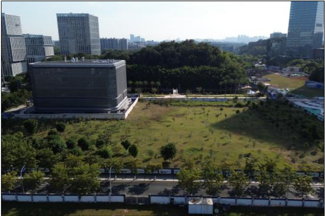
图 14 17 (AH0915017) 地块现状 (北-南)