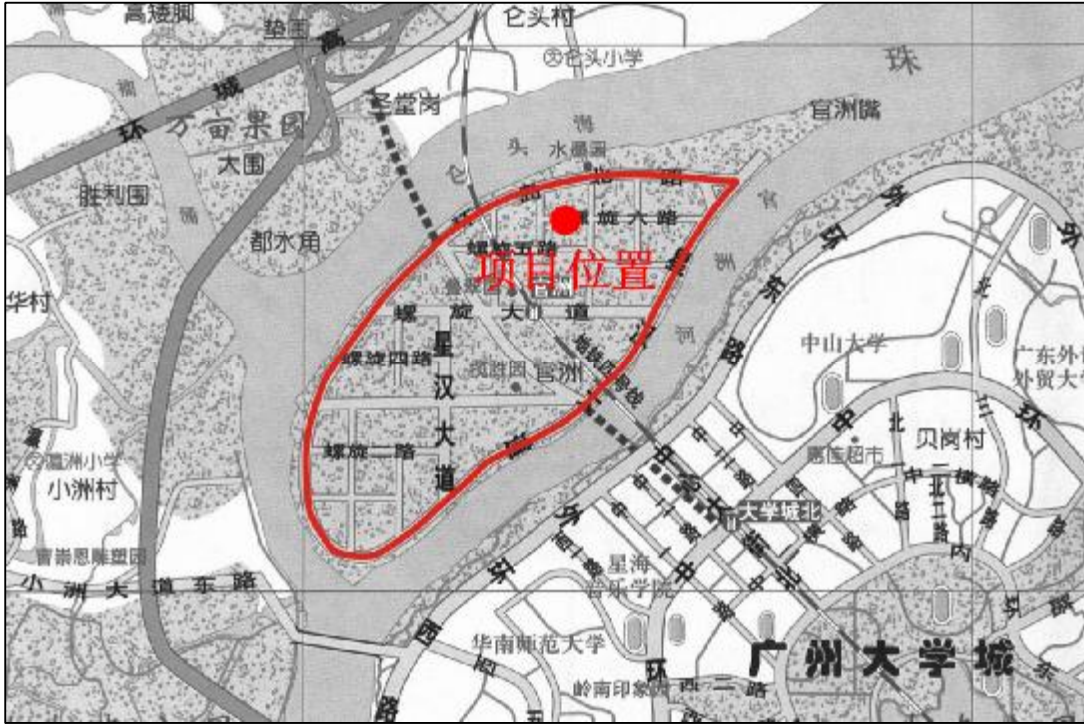
图 6 该项目在“官洲岛”地下文物埋藏区位置（红点为项目位置）

地块所属的官洲岛文物资源丰富。根据《广州市文物普查汇编·海珠区卷》记载，官洲岛共有文物资源 22 处。有以华帝古庙为代表的庙宇，有以陈氏大宗祠为代表的祠堂，有以桂林里门楼为代表的门楼建筑，更多的是以由义里大街 9 号为代表的民居。不过这些文物资源基本都在岛中部的官洲村，离该地块较远。