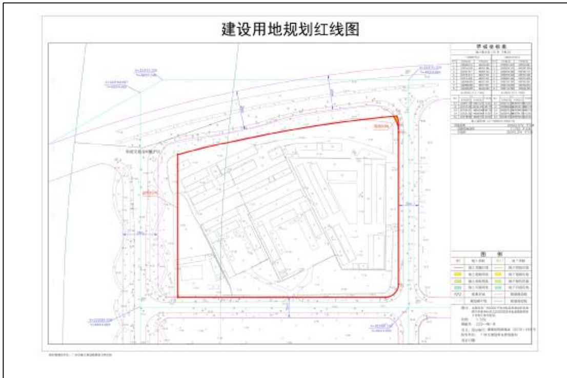
图 4 16 (AH0915015) 地块红线图