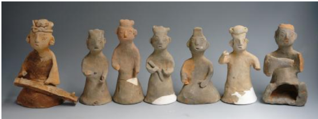
图 10 花果山东汉墓 M1 出土陶俑