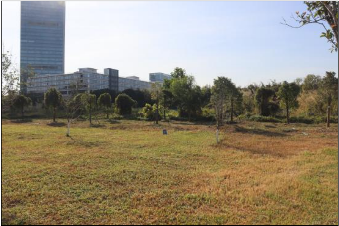
图 18 17 (AH0915017) 地块西部现状 (东北-西南)