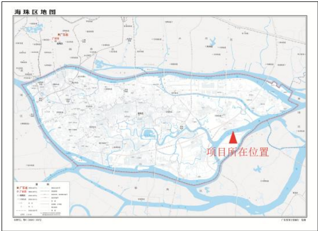
图 2 该项目地块在海珠区位置示意图（广东省国土资源厅）