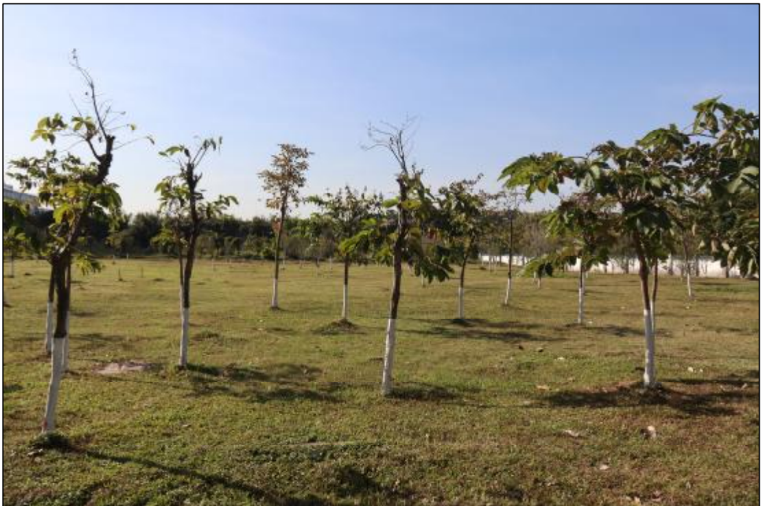
图 15 17 (AH0915017) 地块东部现状 (东-西)