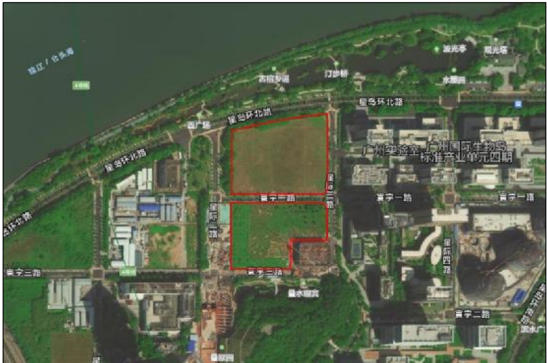
图 3 广州国际生物岛 16 (AH0915015)、17 (AH0915017) 地块卫星图（腾讯卫星地图）