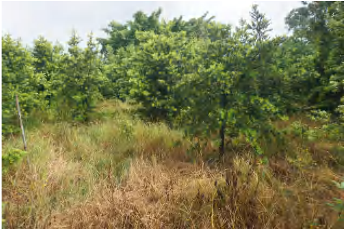
图 12 地块内部现状（东北-西南）