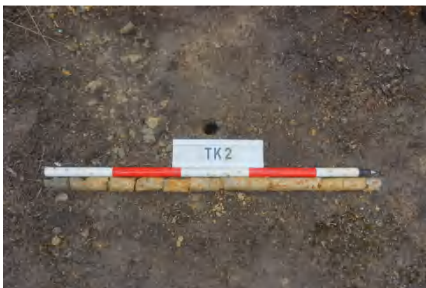
图 26 TK2 土样（标杆长 1 米，土样由左到右）

①层：表土层，距地表 0-0.1 米，厚约 0.1 米，为灰褐色黏土，土质疏松，包含植物根茎、石子、沙粒等。该层下即生土，勘探至 1 米，为黄褐色黏土，土质致密、纯净。