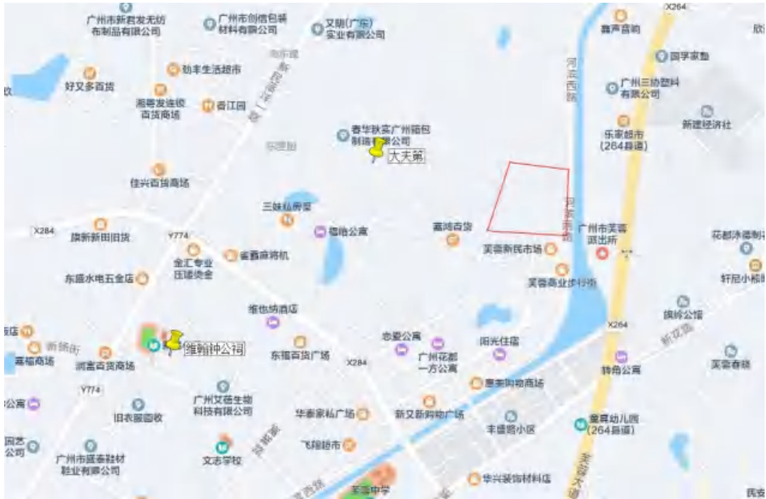
图 6 地块周边文物分布示意图

本次考古调查在项目地块内未发现不可移动文物，根据《广州市文物普查汇编·花都区卷》记载，距离地块较近的文物资源主要有维翰钟公祠、新民村大夫第。