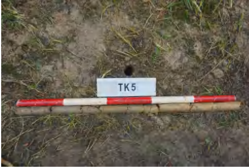
图 29 TK5 土样（标杆长 1 米，土样由左到右）

①层：表土层，距地表0-0.6米，厚约0.6米，为灰褐色黏土，土质疏松，包含植物根茎、石子、沙粒等。该层下即生土，勘探至1米，为黄褐色黏土，土质致密、纯净。