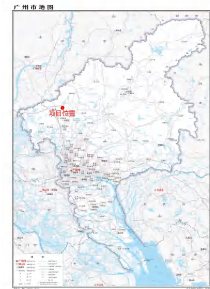
图 1 项目地块在广州市位置示意图(广东省国土资源厅)

根据《中华人民共和国文物保护法》《广州市文物保护规定》,按照《广州市文物局关于花都区新民村保障性住房项目(一期)地块考古调查、勘探工作的复函》(文物 2023485 号)指导意见,受广州珠江住房租赁发展投资有限公司的委托,由我院负责该项目的考古调查工作。