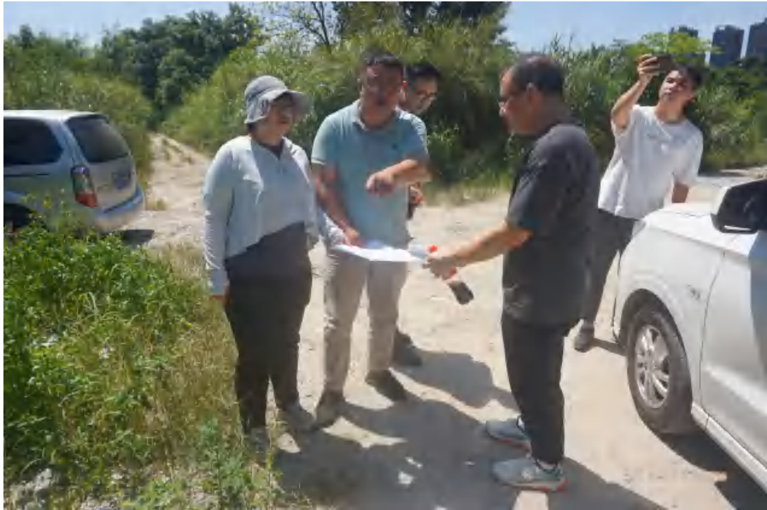
图 8 工作人员现场核对地块范围（东-西）