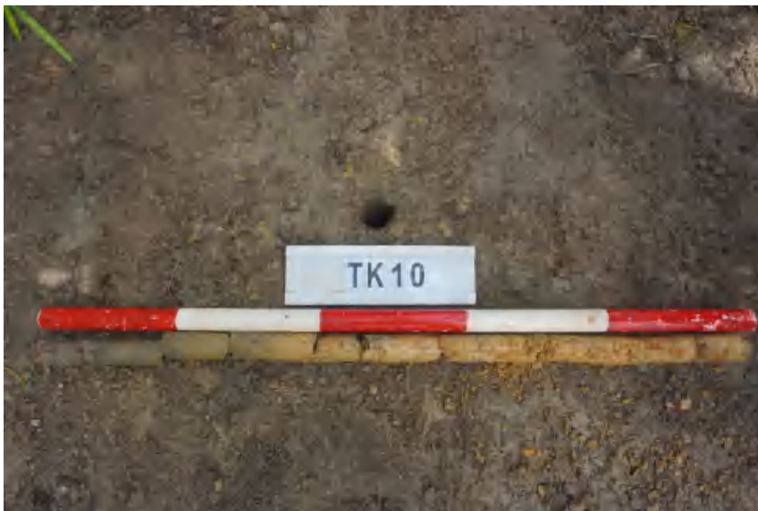
图 34 TK10 土样 (标杆长 1 米, 土样由左到右)

①层: 表土层, 距地表 0-0.4 米, 厚约 0.4 米, 为灰褐色黏土, 土质疏松, 包含植物根茎、石子、沙粒等。该层下即生土, 勘探至 1 米, 为黄褐色黏土, 土质致密、纯净。