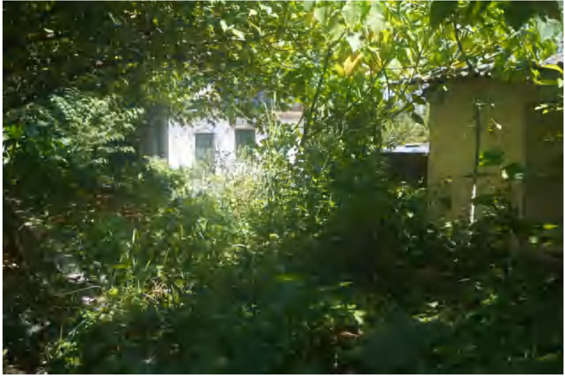
图 17 地块内部现状（南-北）