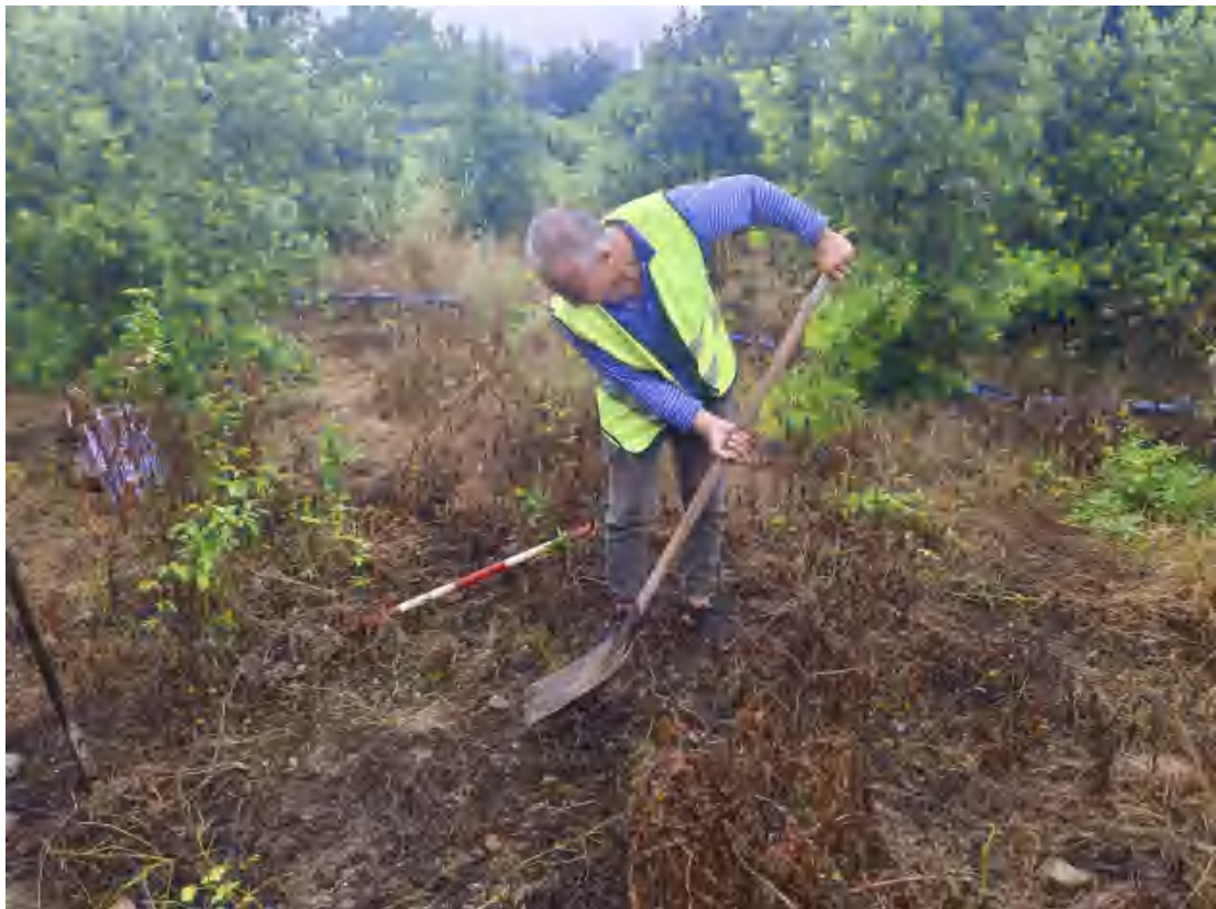
图 22 试探前清表工作照（北-南）