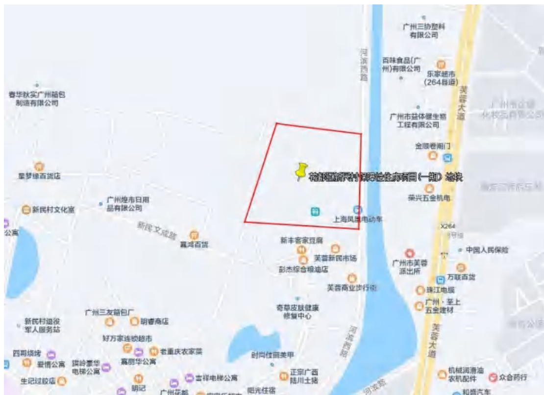
图 3 项目地块周边环境示意图（腾讯地图）