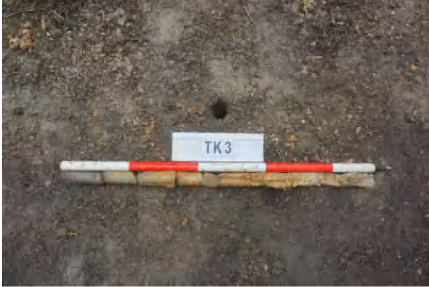
图 27 TK3 土样（标杆长 1 米，土样由左到右）

①层：表土层，距地表 0-0.3 米，厚约 0.3 米，为灰褐色黏土，土质疏松，包含植物根茎、石子、沙粒等。该层下即生土，勘探至 1 米，为黄褐色黏土，土质致密、纯净。