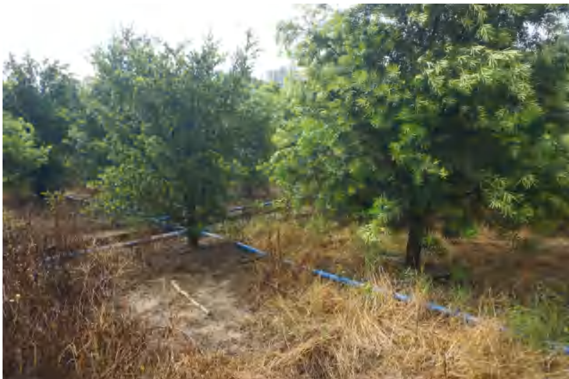
图 20 地块内部现状（西南-东北）