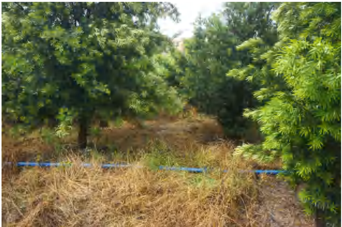
图 18 地块内部现状（西-东）