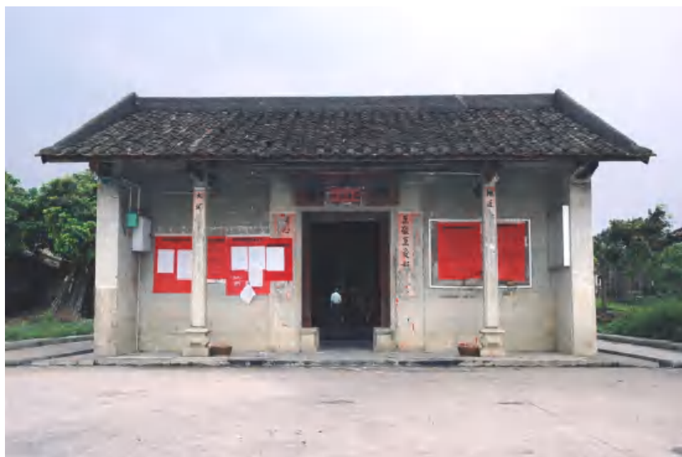
图 7 新民村大夫第