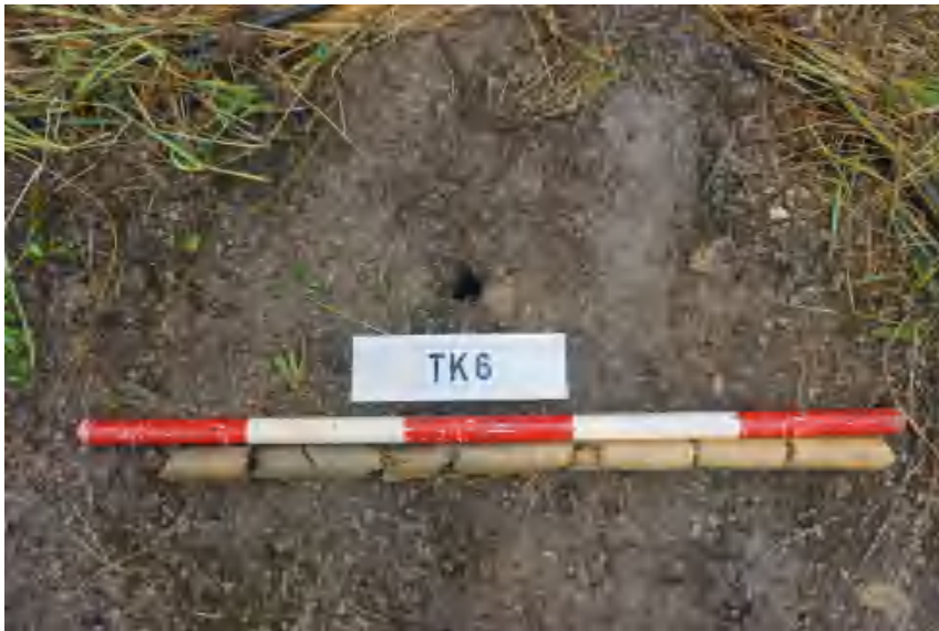
图 30 TK6 土样（标杆长 1 米，土样由左到右）

①层：表土层，距地表0-0.5米，厚约0.5米，为灰褐色黏土，土质疏松，包含植物根茎、石子、沙粒等。该层下即生土，勘探至1米，为黄褐色黏土，土质致密、纯净。