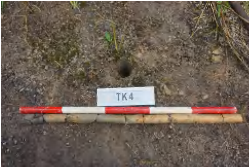
图 28 TK4 土样（标杆长 1 米，土样由左到右）

①层：表土层，距地表 0-0.5 米，厚约 0.5 米，为灰褐色夹杂黄褐色黏土，土质疏松，包含植物根茎、石子、沙粒等。该层下即生土，勘探至 1 米，为黄褐色黏土，土质致密、纯净。