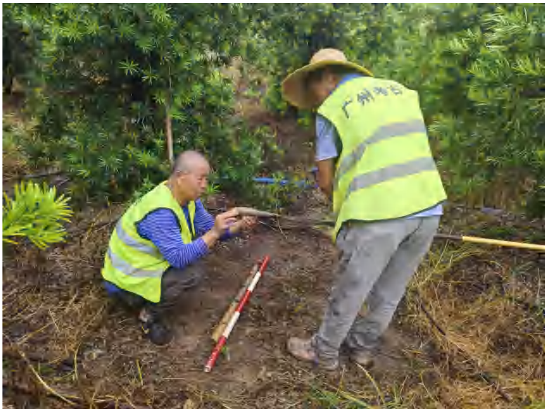
图 24 分析土样工作照（东-西）