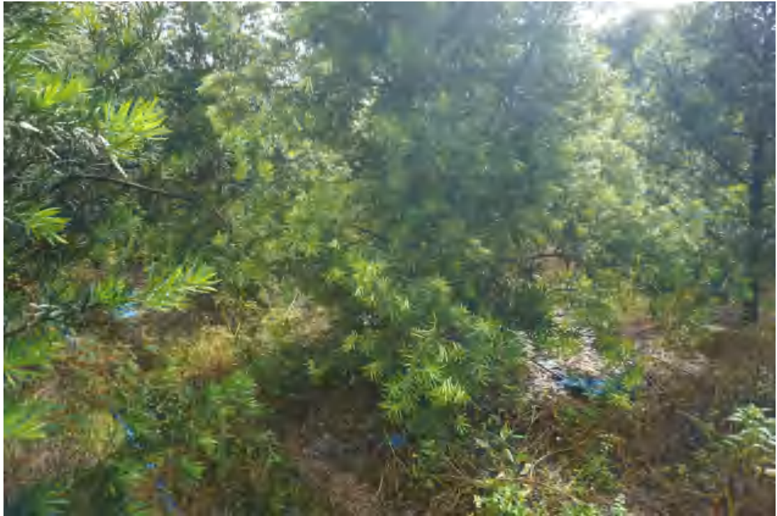
图 15 地块内部现状（南-北）