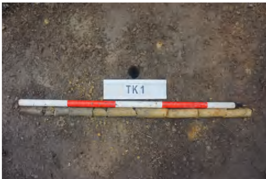
图 25 TK1 土样（标杆长 1 米，土样由左到右）

①层：表土层，距地表 0-0.6 米，厚约 0.6 米，为灰褐色黏土，土质疏松，包含植物根茎、石子、沙粒等。该层下即生土，勘探至 1 米，为黄褐色黏土，土质致密、纯净。