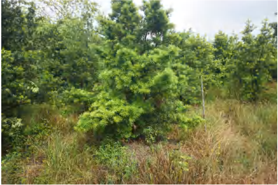
图 11 地块内部现状（北-南）