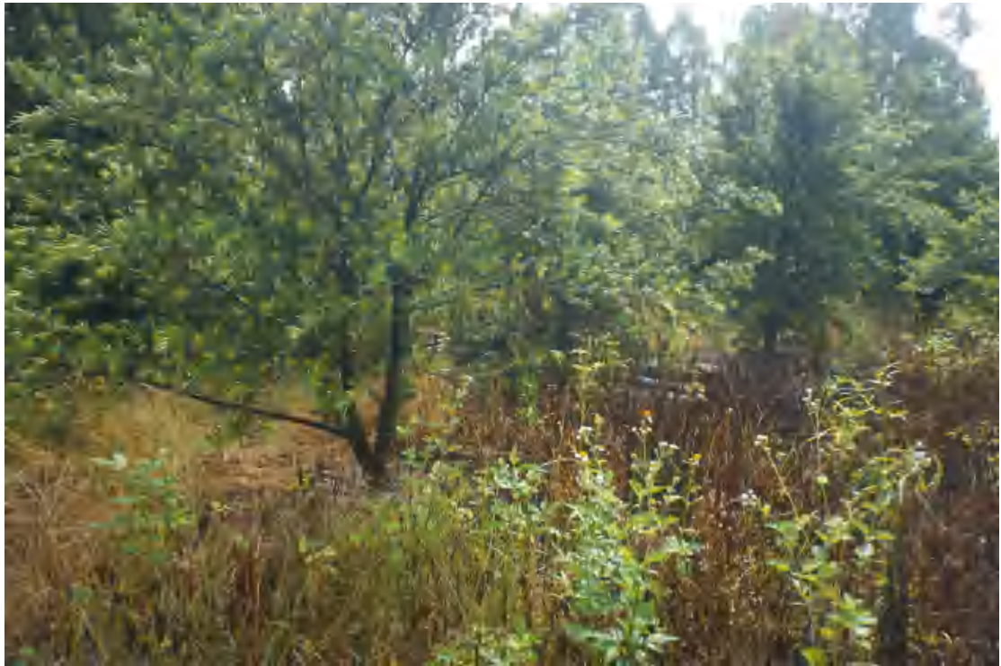
图 13 地块内部现状（东南-西北）