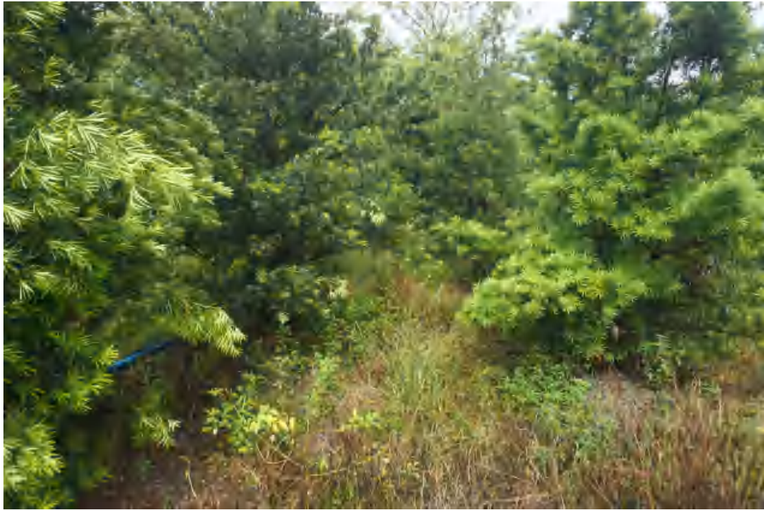
图 19 地块内部现状（西北-东南）