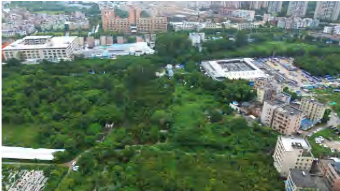
图 10 地块整体现状（上为东）