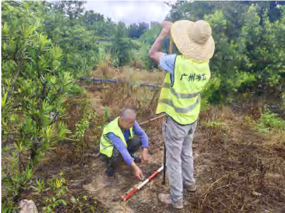
图 23 现场试探工作照（南-北）