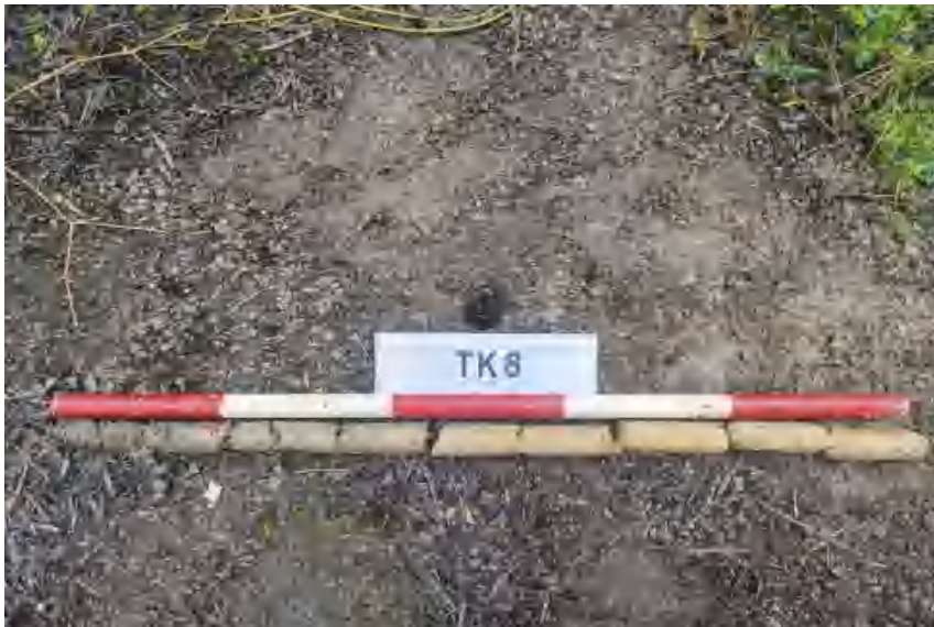
图 32 TK8 土样（标杆长 1 米，土样由左到右）

①层：表土层，距地表 0-0.5 米，厚约 0.5 米，为灰褐色黏土，土质疏松，包含植物根茎、石子、沙粒等。该层下即生土，勘探至 1 米，为黄褐色黏土，土质致密、纯净。