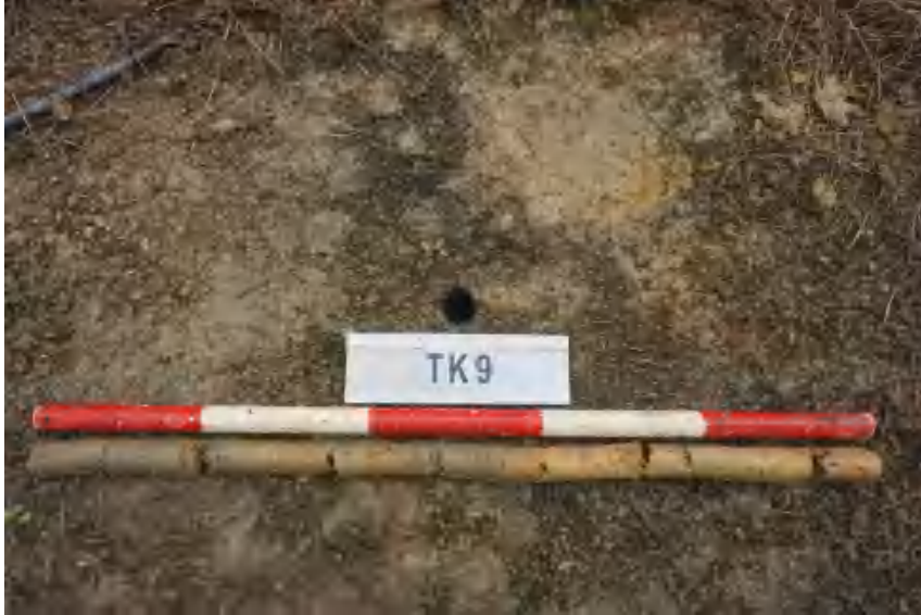
图 33 TK9 土样 (标杆长 1 米, 土样由左到右)

①层: 表土层, 距地表 0-0.6 米, 厚约 0.6 米, 为灰褐色夹杂黄褐色黏土, 土质疏松, 包含植物根茎、石子、沙粒等。该层下即生土, 勘探至 1 米, 为黄褐色黏土, 土质致密、纯净。