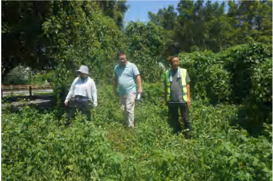
图 9 工作人员现场踏查（北-南）