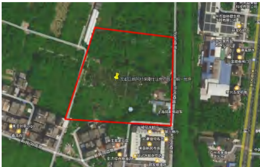
图 4 项目地块卫星影像图