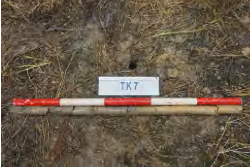
图 31 TK7 土样（标杆长 1 米，土样由左到右）

①层：表土层，距地表 0-0.6 米，厚约 0.6 米，为灰褐色黏土，土质疏松，包含植物根茎、石子、沙粒等。该层下即生土，勘探至 1 米，为黄褐色黏土，土质致密、纯净。