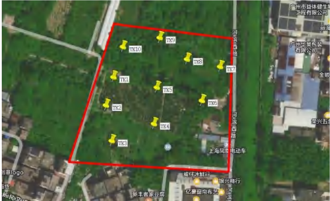
图 21 地块内试探探孔位置示意图（黄色标记点）

为了进一步掌握地块内的地层情况，根据实际条件，我们在地块内部进行了探孔试探，编号为TK1-TK10，其具体情况如下：