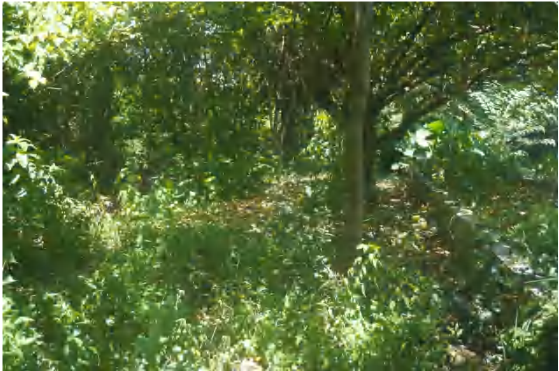
图 16 地块内部现状（南-北）