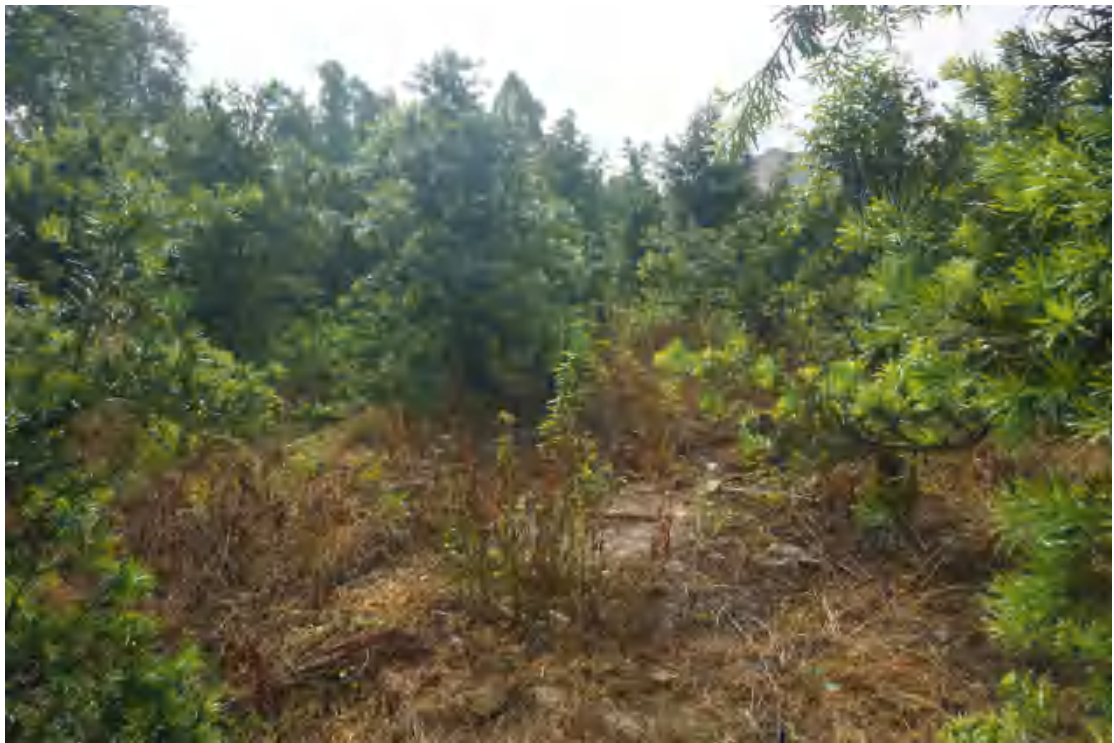
图 14 地块内部现状（南-北）