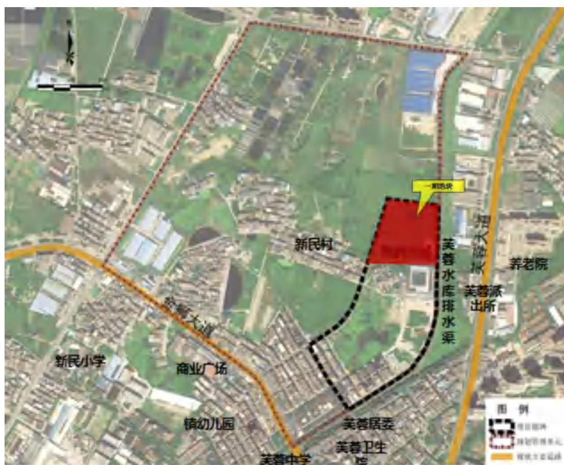
图 5 该项目地块地形卫星红线图