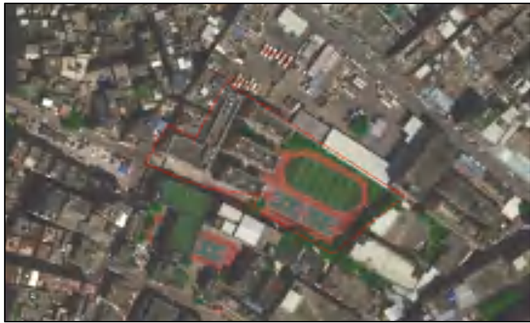
图 3 项目卫星红线图