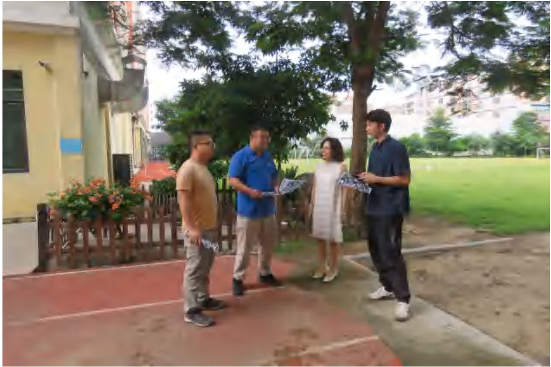
图 6 与工作人员确认项目用地范围（北-南）