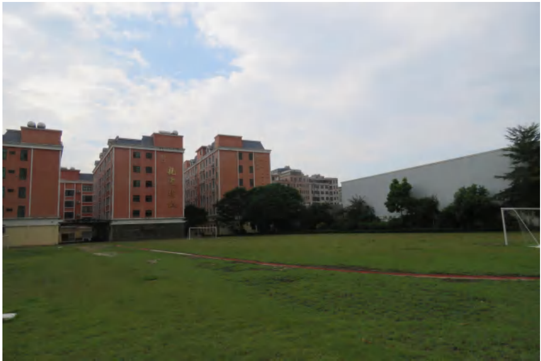
图 13 项目用地地表现状（东-西）