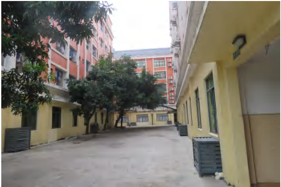
图 9 项目用地地表现状（北-南）