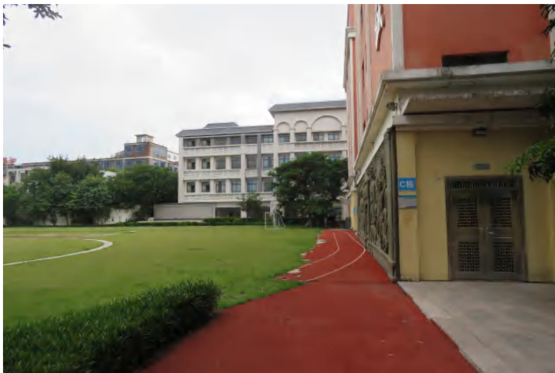
图 10 项目用地地表现状（南-北）