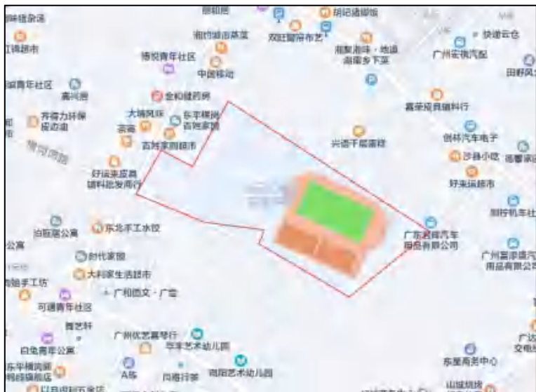
图 4 项目周边环境示意图（腾讯地图）