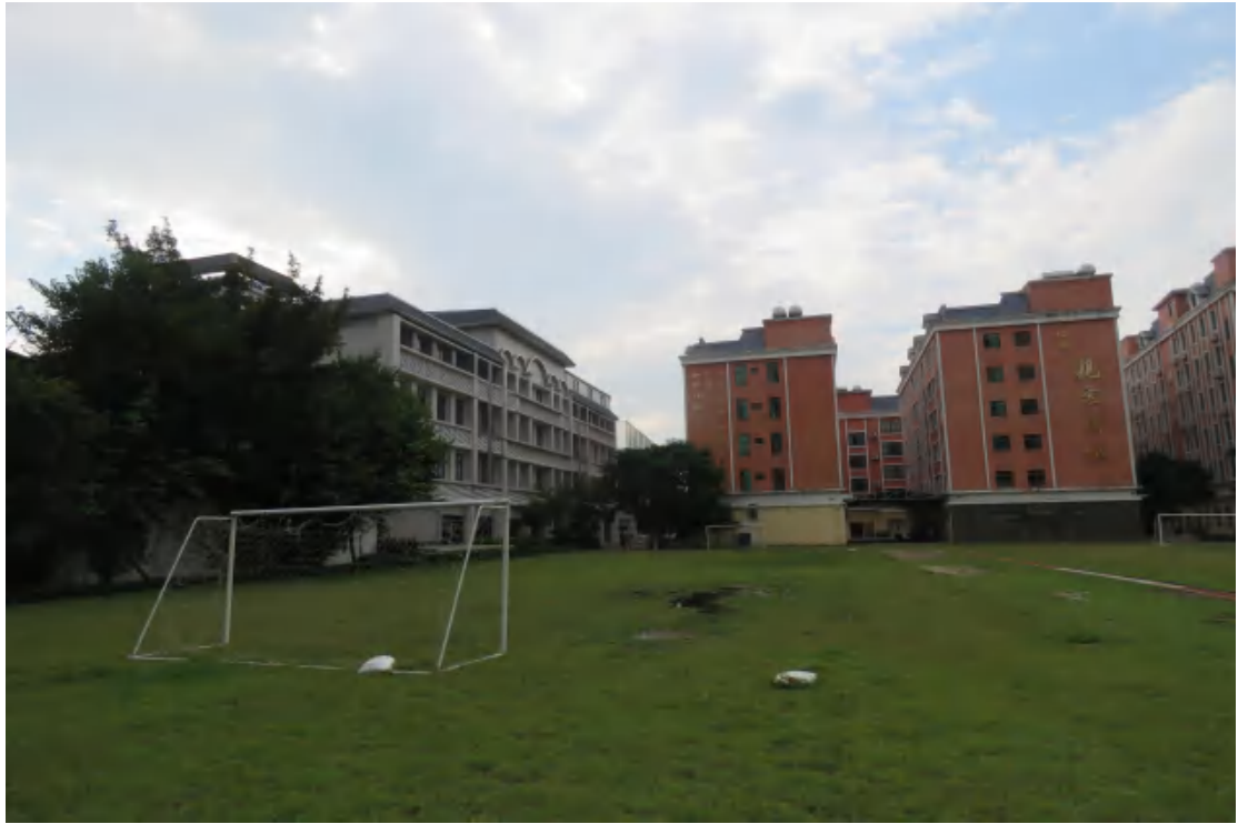
图 12 项目用地地表现状（北-南）