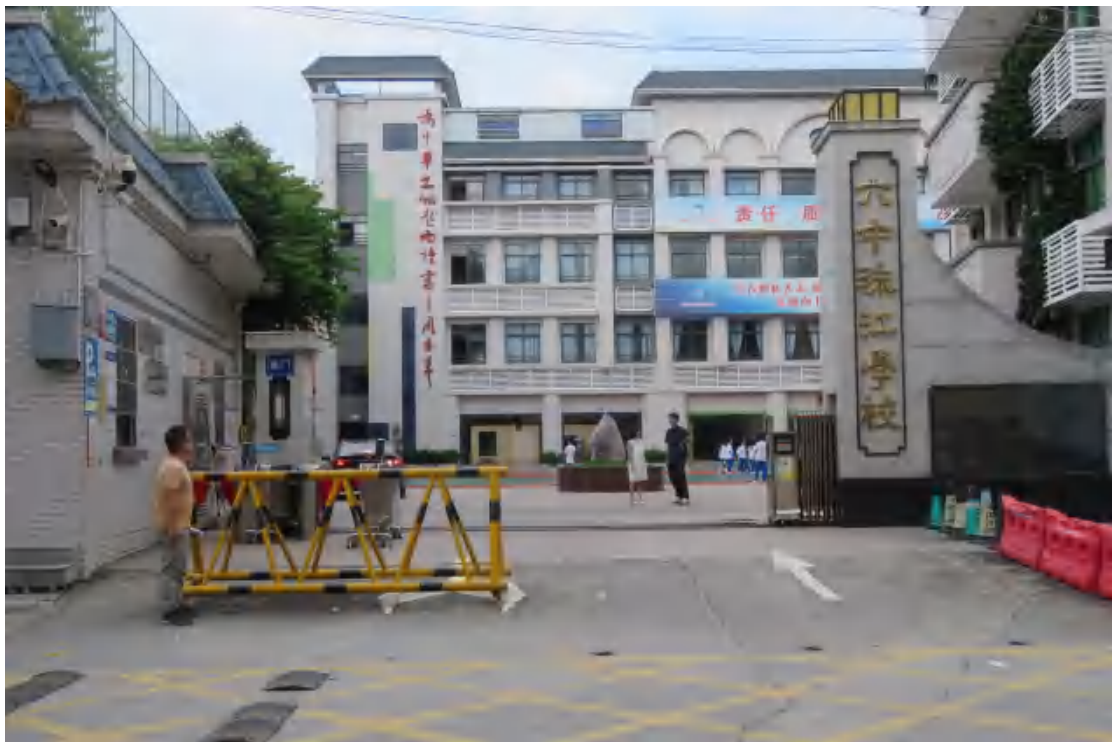
图 7 对项目用地地表进行踏查（东-西）