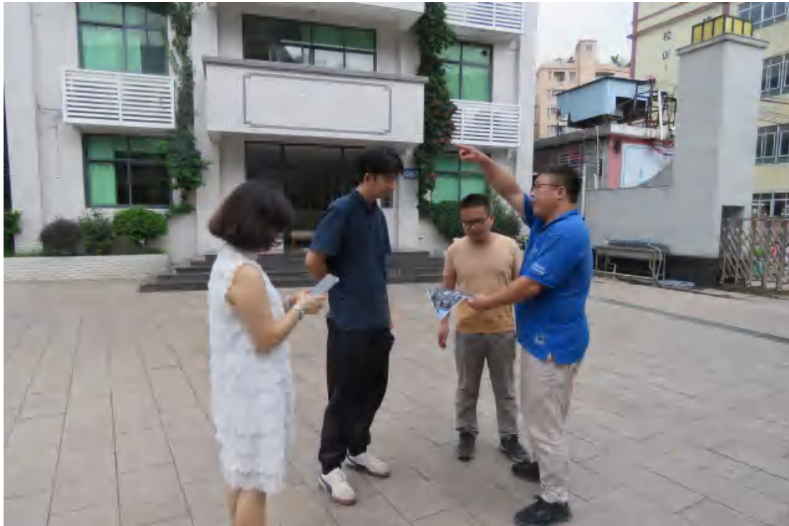
图5 与工作人员确认项目用地范围（南-北）