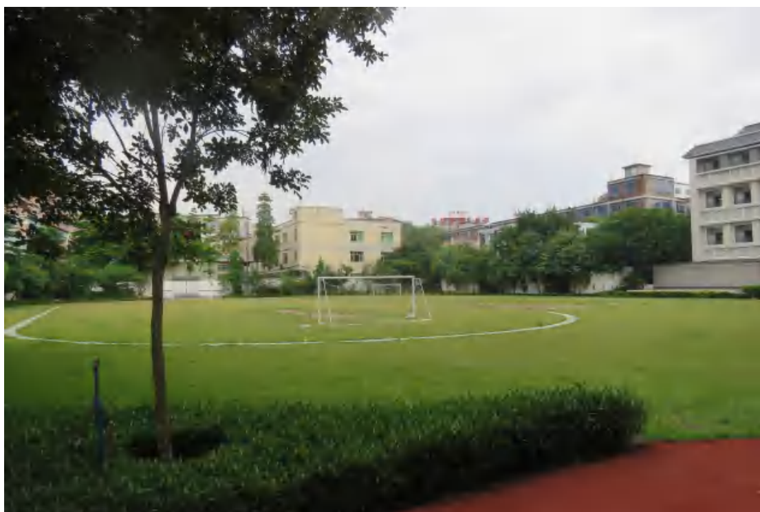
图 11 项目用地地表现状（西-东）