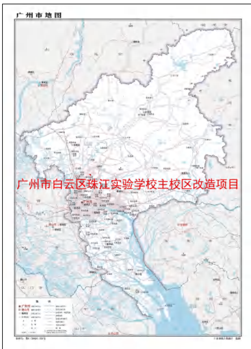
图 1 项目用地在广州市的位置示意图(广东省国土资源厅)

根据《中华人民共和国文物保护法》《广州市文物保护规定》，按照《广州市文物局关于广州市白云区珠江实验学校主校区改造项目考古调查勘探工作的复函》（文物 20231116 号）的指导意见，受广州市白云区珠江实验学校委托，由我院配合该工程建设，对该项目用地进行考古调查工作。