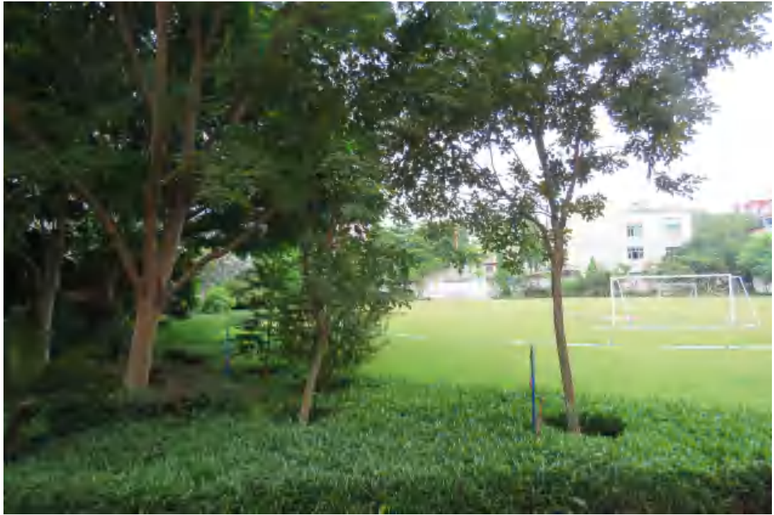
图 8 项目用地地表现状（东-西）