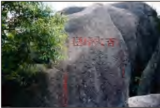
图 5 “百丈晴峦”题刻

福厚家塾 位于梯面镇民安村，俗称和合屋，客家围楼建筑。建于民国 24 年（1935）。坐南朝北，呈长方形，总面阔 25.7 米，总进深 33.3 米，建筑占地 874 平方米。2005 年 9 月，公布为花都区文物保护单位。