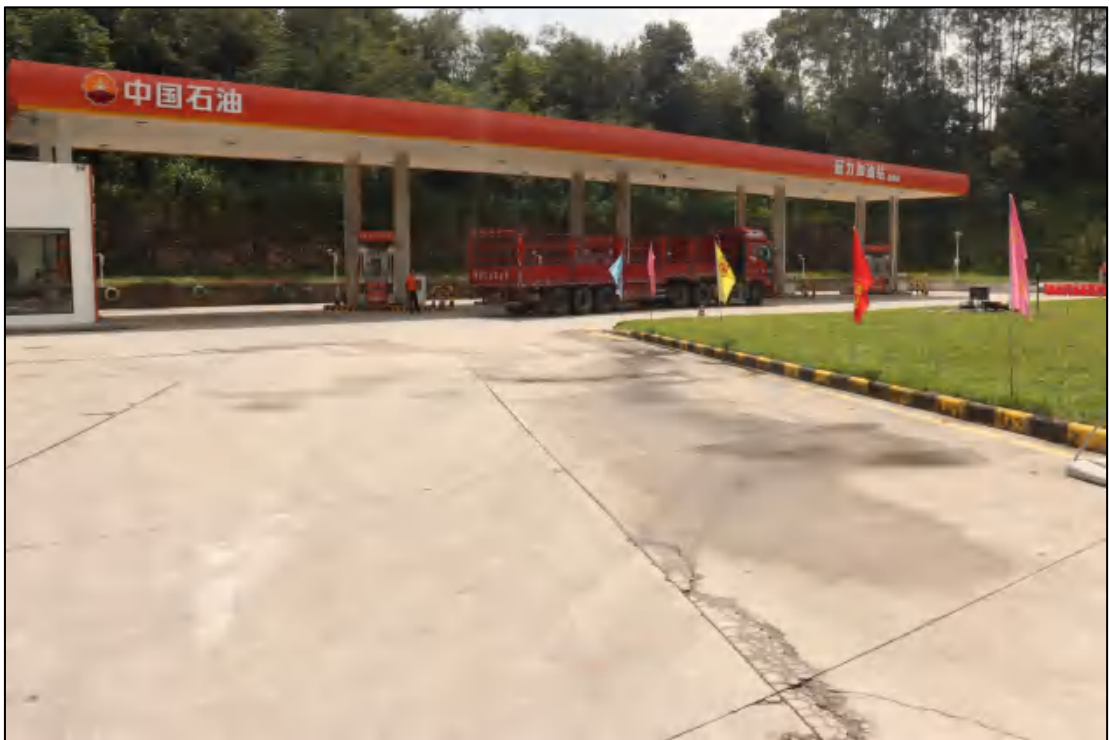
图 13 地块内部现状（西-东）