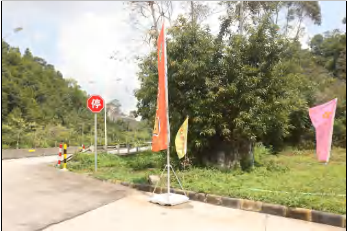
图 12 地块内部现状（南-北）