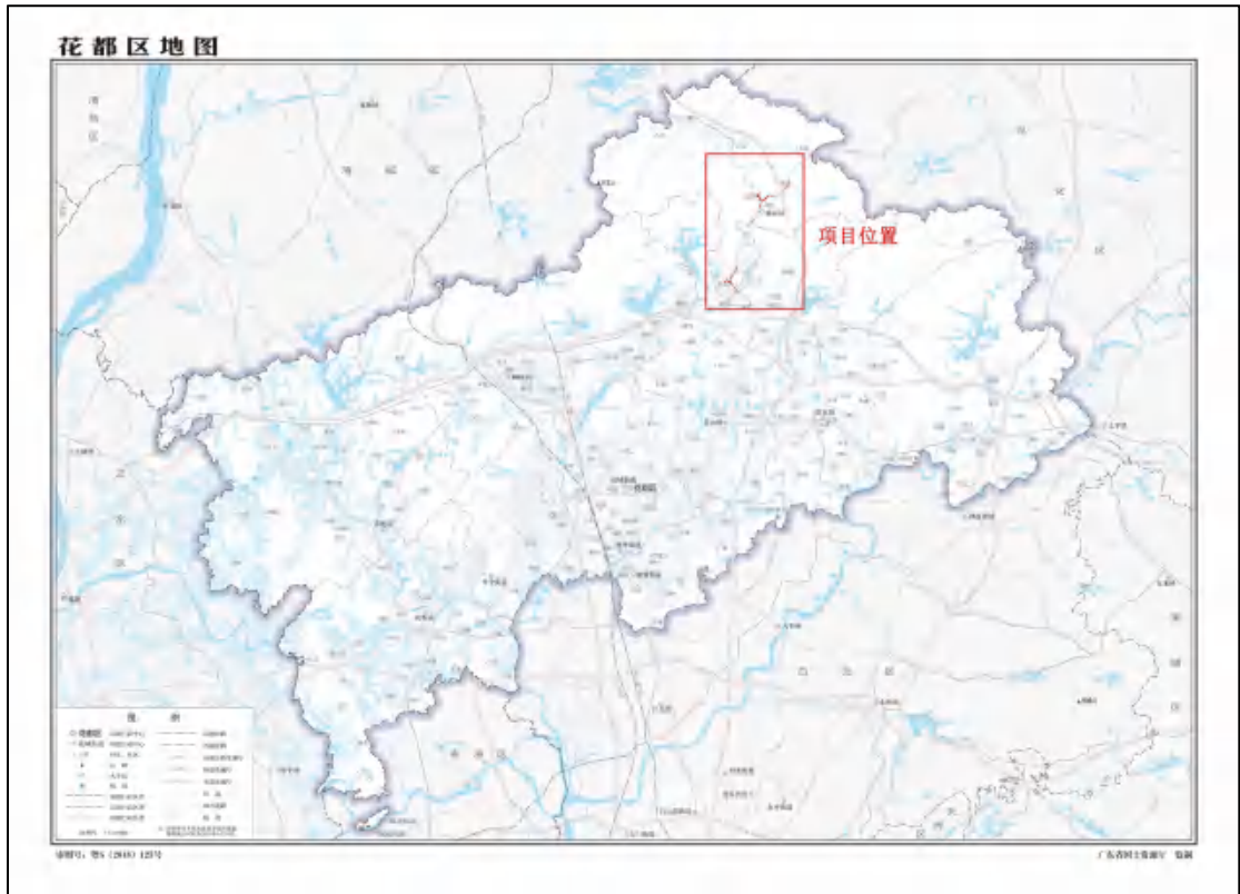
图 2 花都区梯面镇排水单元配套公共管网工程在花都区位置图（广东省国土资源厅）