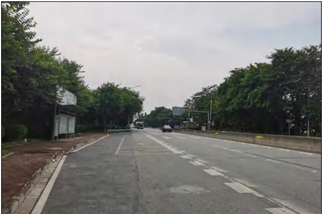
图 17 地块内部现状（西-东）