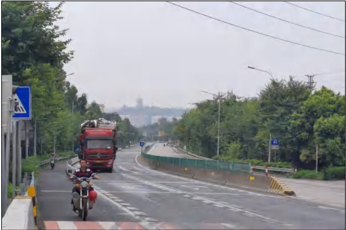
图 16 地块内部现状（南-北）