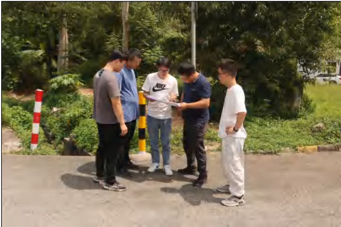
图 7 工作人员现场查看图纸（南-北）