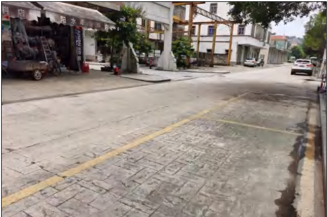
图 15 地块内部现状（西-东）