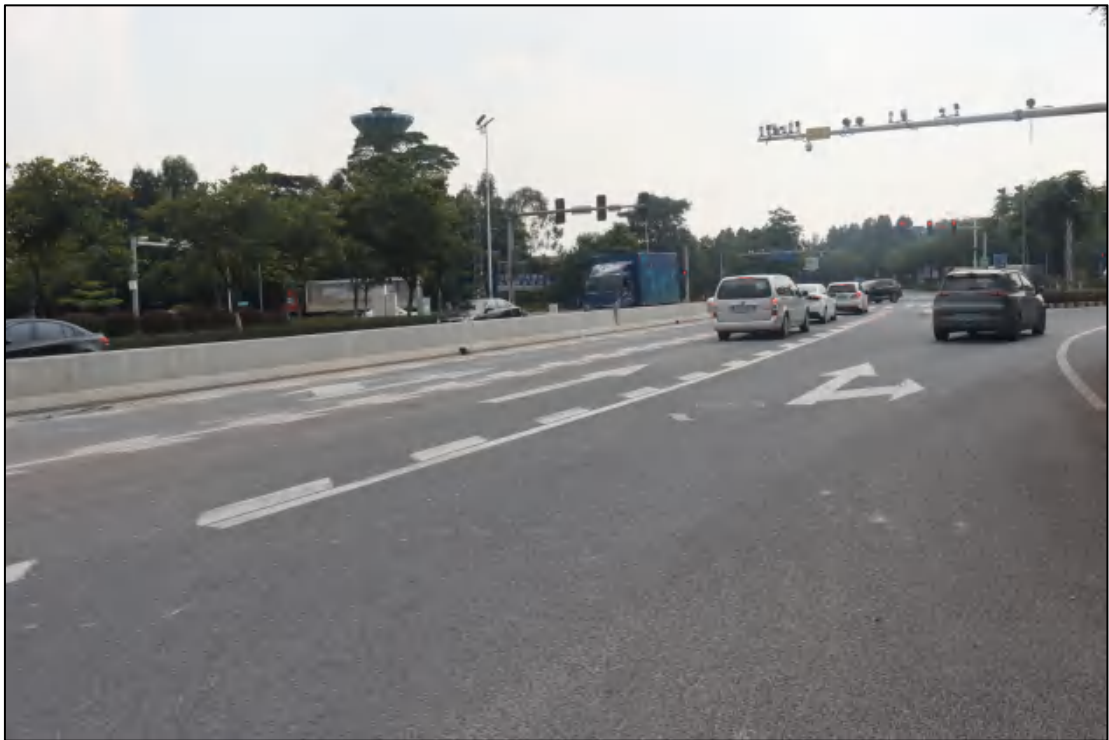
图 9 地块内部现状（北-南）