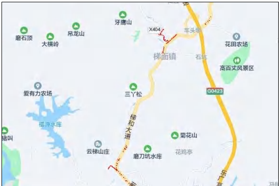
图 3 花都区梯面镇排水单元配套公共管网工程周边环境示意图（腾讯地图）