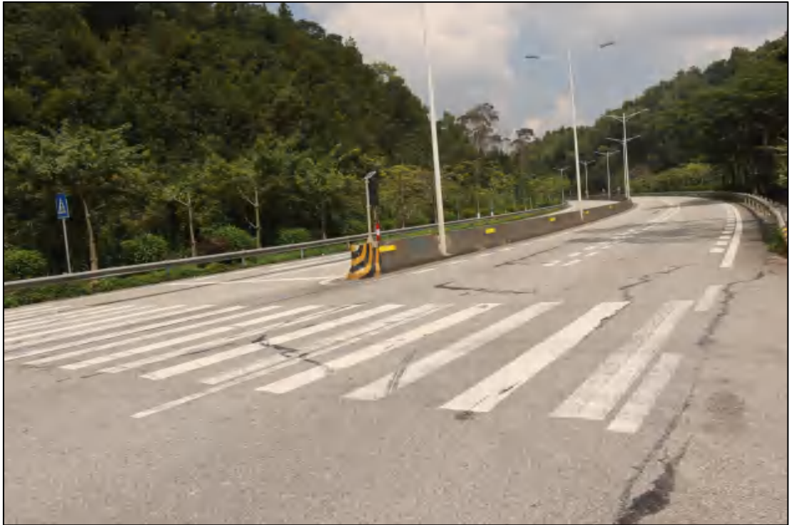
图 10 地块内部现状（北-南）