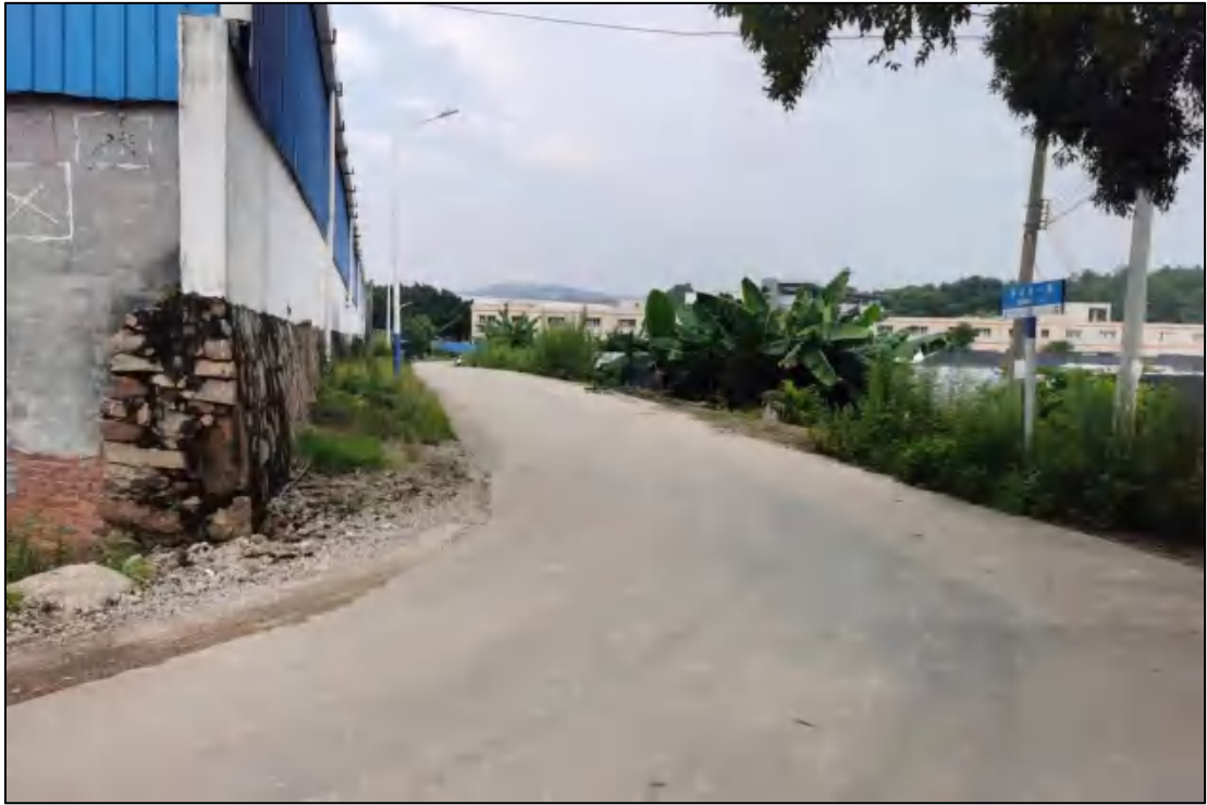
图 14 地块内部现状（南-北）