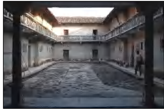
图 6 福厚家塾

百步梯遗址 位于梯面镇民安村北侧山岭上。清顺治四年（1647），练复宁、吴万雄从循州率众入踞盘古峒（今梯面镇一带）聚义，号“花山寨”，凭借山岭险峻对抗官府，此地群山因此被统称“花山”。清康熙二十一年（1682），广东巡抚李士桢派兵镇压花山寨而扩宽此山道。道光二十年（1840），县令包锦灿重修山道，铺砌花岗岩条石共 366 级，长 256 米、宽 1.8 米，呈“之”字状盘山而上，远望宛似云梯，所以叫百步梯。2008 年 12 月，公布为广州市文物保护单位，2015 年 6 月重新核定。