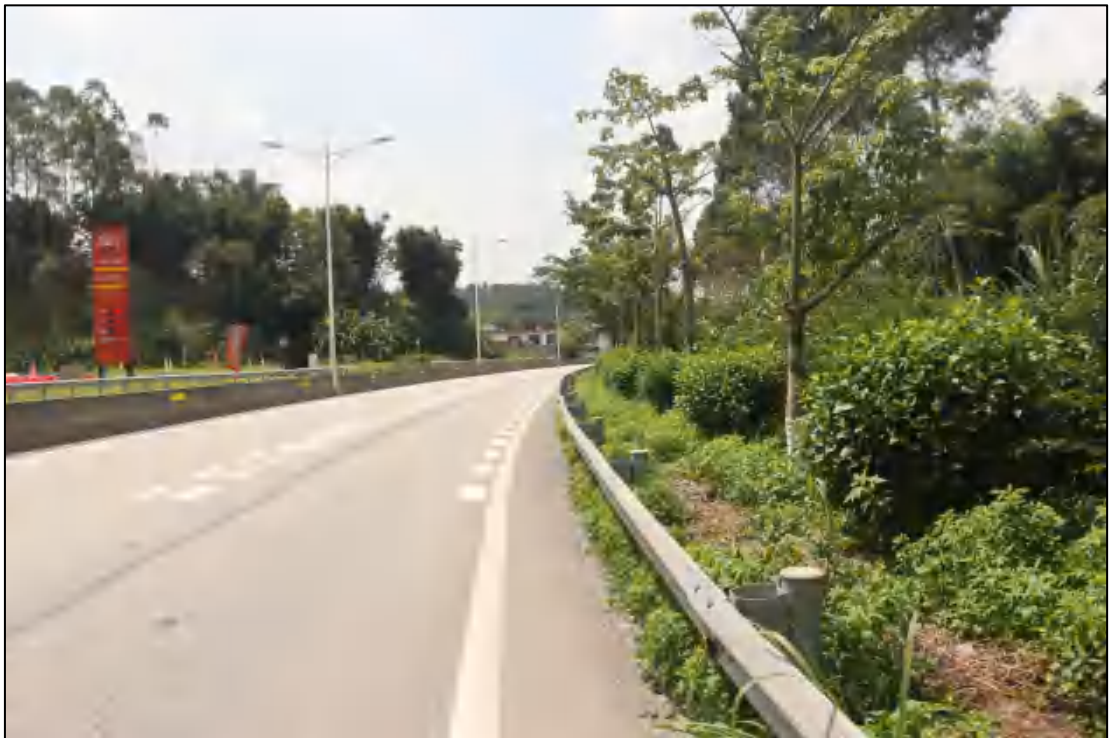
图 11 地块内部现状（北-南）