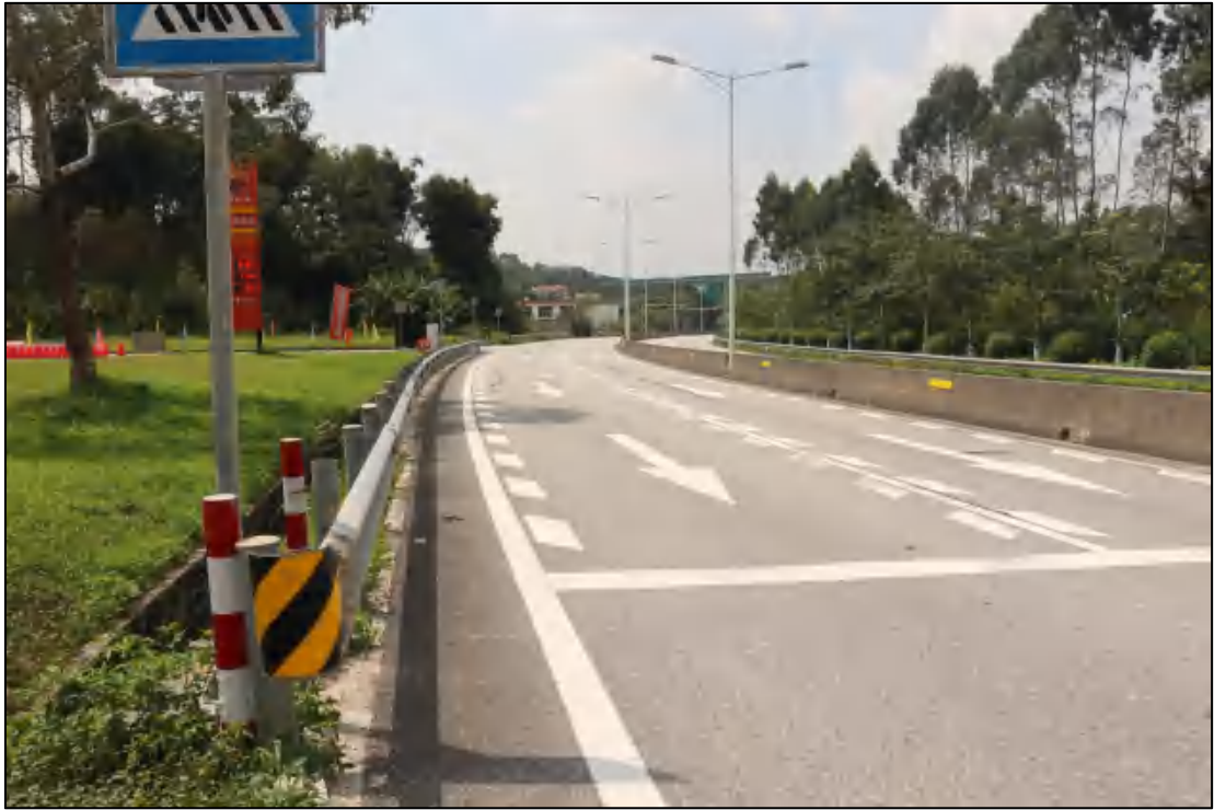
图 8 地块内部现状（北-南）