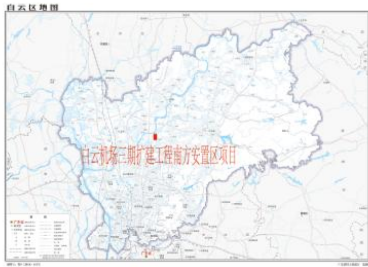
图 2 项目地块在白云区位置示意图（广东省国土资源厅）