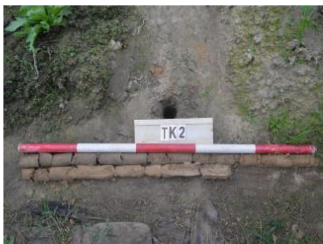
图 34 TK2土样（一米标杆，土样由左上往右下）

①层：现代回填土层，距地表深约0-0.6米，厚约0.6米，为灰褐色沙土，土质疏松，含植物根系等；以下为黄褐色细沙，土质致密、纯净，系生土。