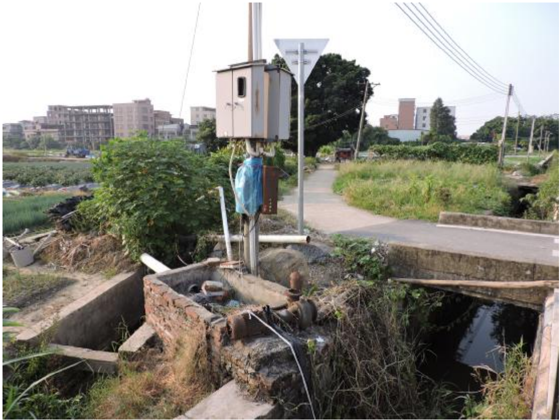
图 22 地表现状（南—北）