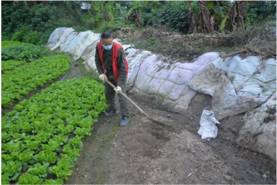
图 29 试探区域表面清理（东-西）