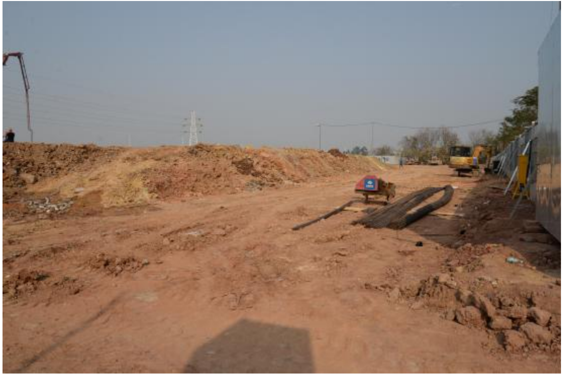
图 12 地表现状（西-东）