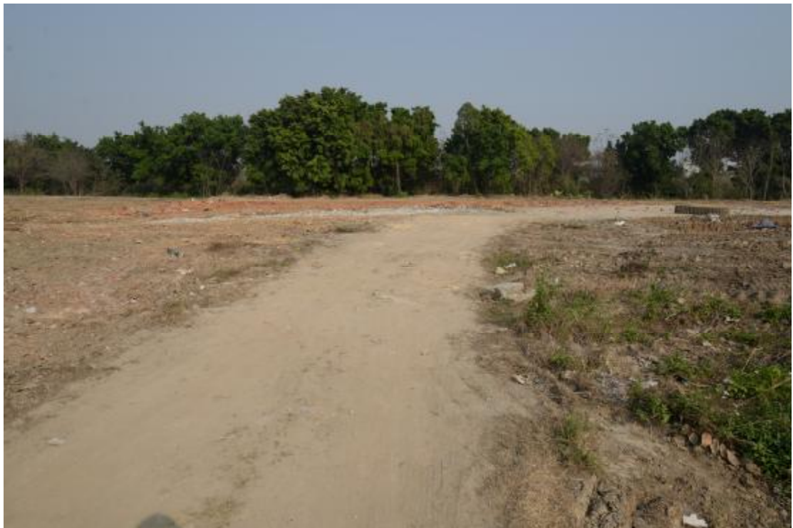
图 15 地表现状（西-东）