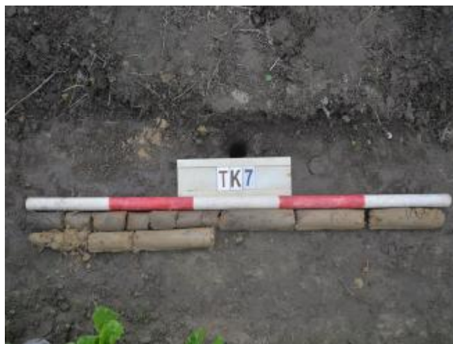
图 39 TK7土样 (一米标杆, 土样由左上往右下)

②层: 沙土层, 距地表深约0.1-0.8米, 厚约0.7米, 为黄褐色沙土, 土质较疏松, 含植物根茎等; 以下为黄褐色细沙, 土质纯净、致密, 系生土。