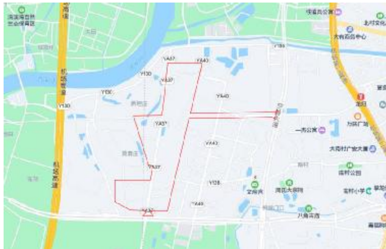
图 3 项目地块周边位置示意图（腾讯地图）