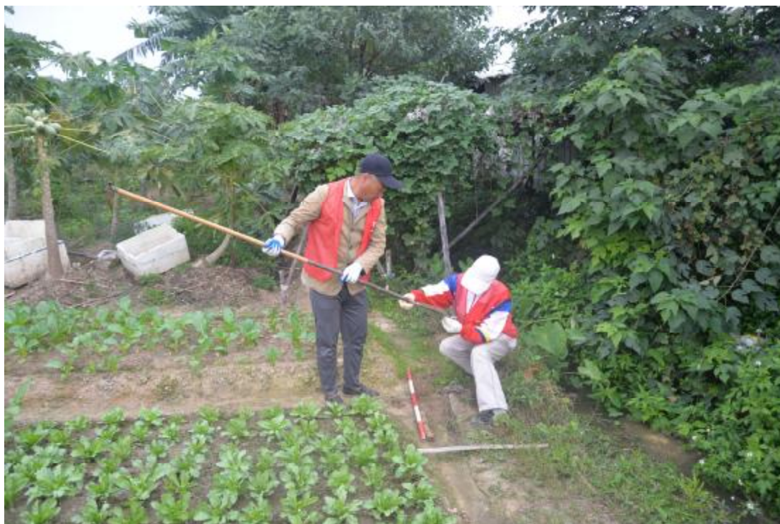
图 31 试探孔土样分析（北-南）