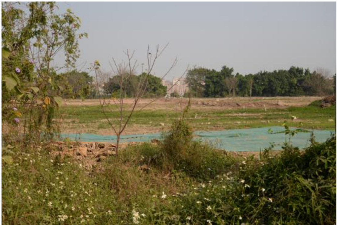
图 11 地表现状（西-东）