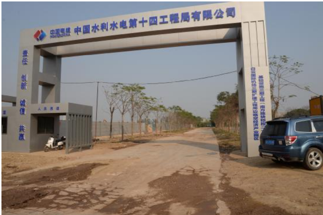
图 17 地表现状（西-东）