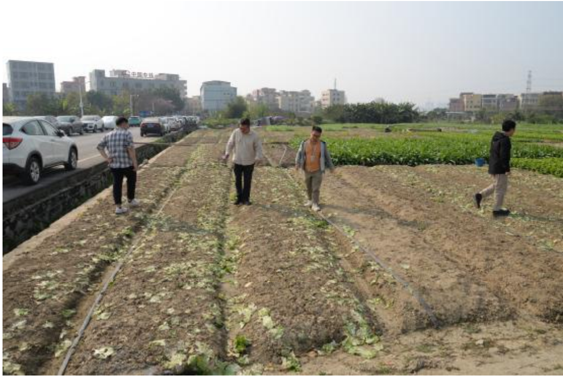
图 6 对地表进行踏查（东-西）