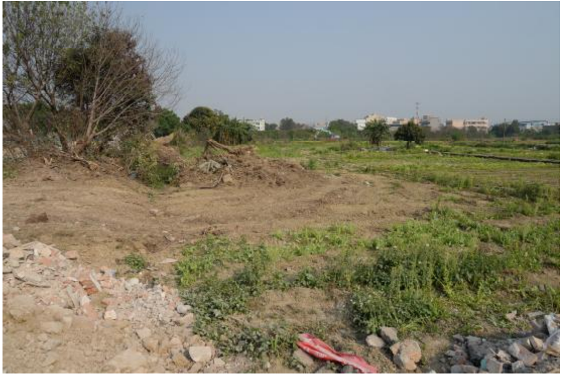
图 14 地表现状（西-东）