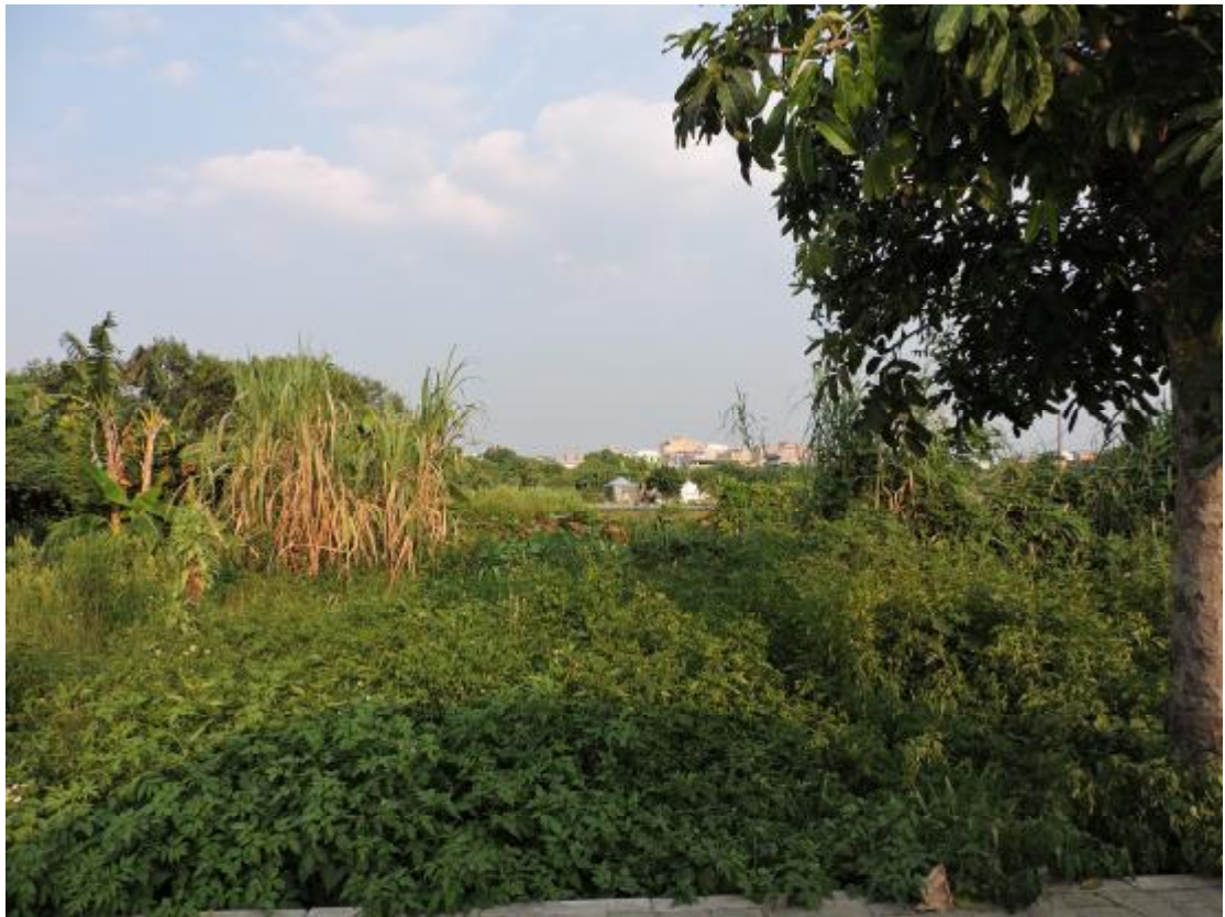
图 25 地表现状（南—北）