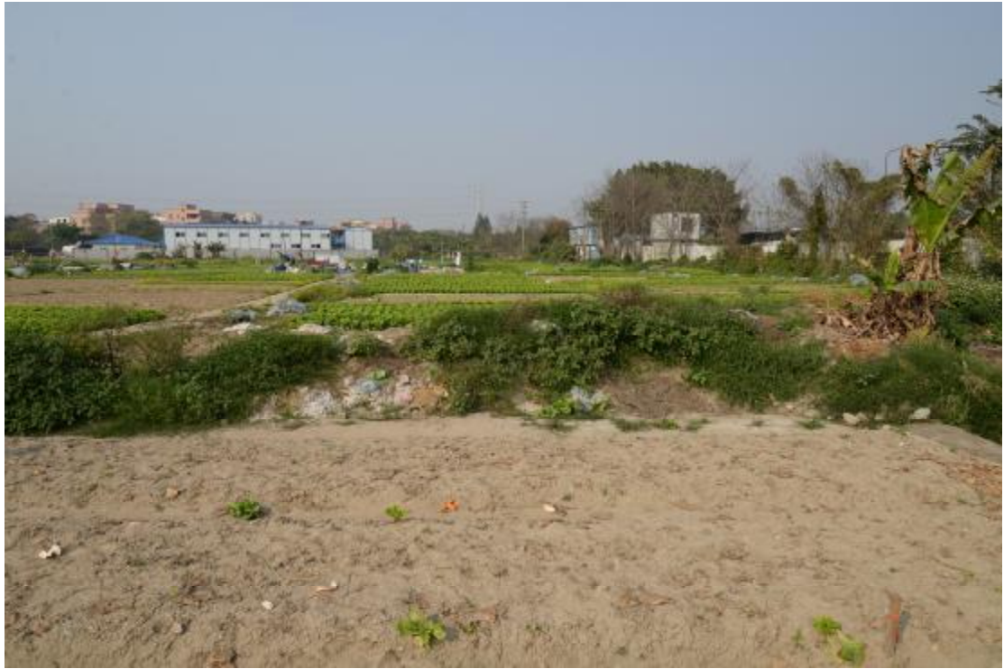
图 8 地表现状（北—南）