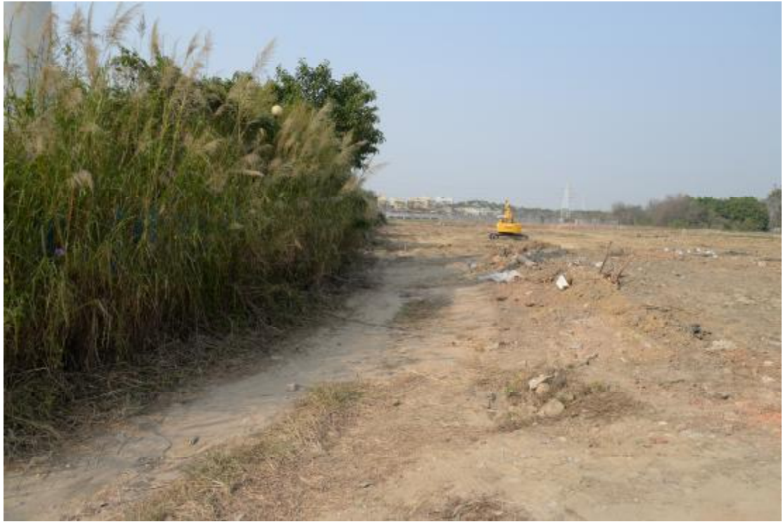
图 10 地表现状（南-北）