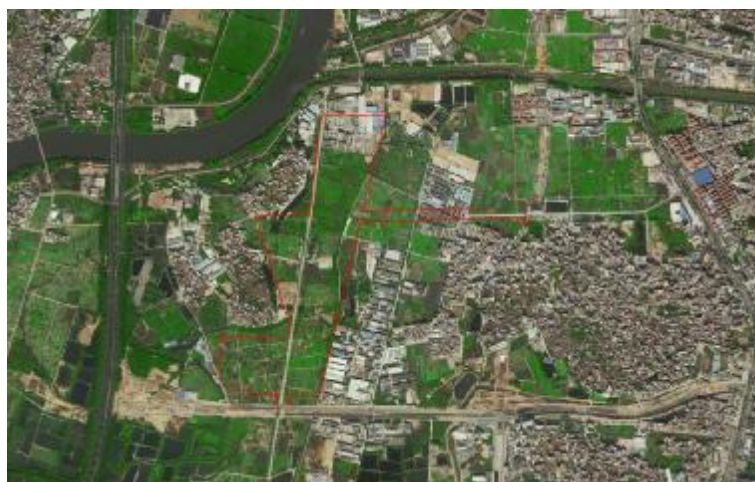
图 4 项目地块卫星影像图（高德地图）