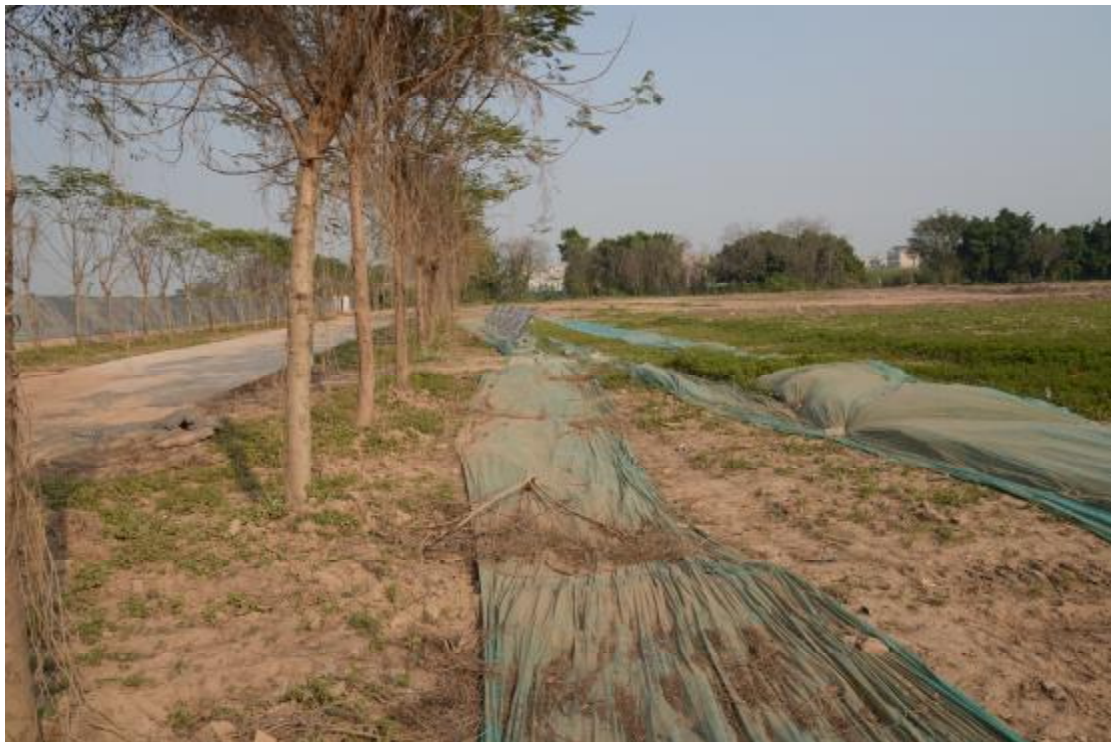
图 19 地表现状（西-东）