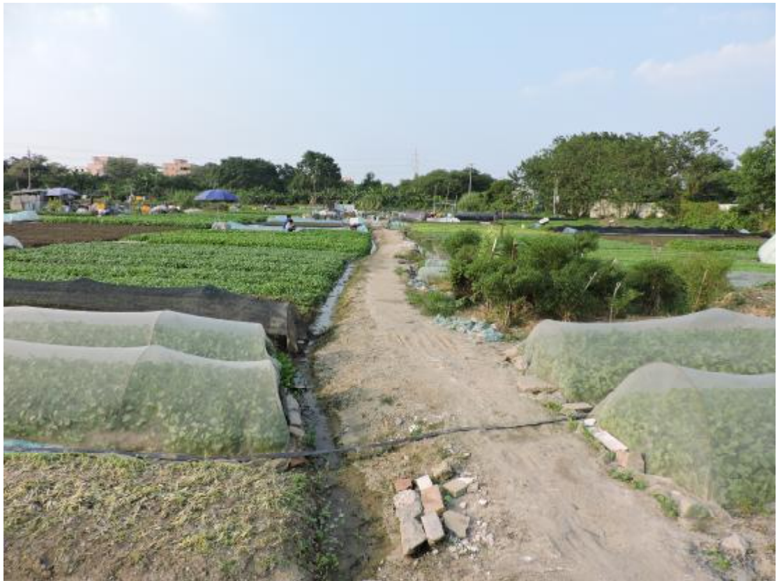
图 23 地表现状（南—北）