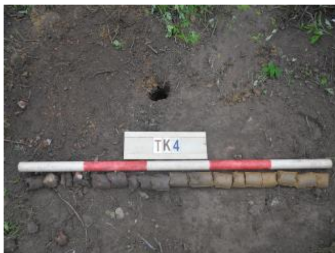
图 36 TK4土样 (一米标杆, 土样由左往右)

①层: 现代回填土层, 距地表深约0-0.6米, 厚约0.6米, 为灰褐色沙土, 土质疏松, 含植物根系、砖粒等; 以下为黄褐色黏土, 土质纯净、致密, 系生土。