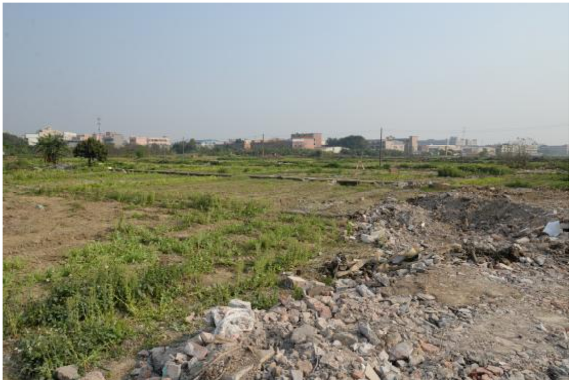
图 13 地表现状（北-南）