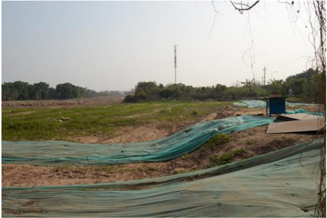
图 18 地表现状（北-南）