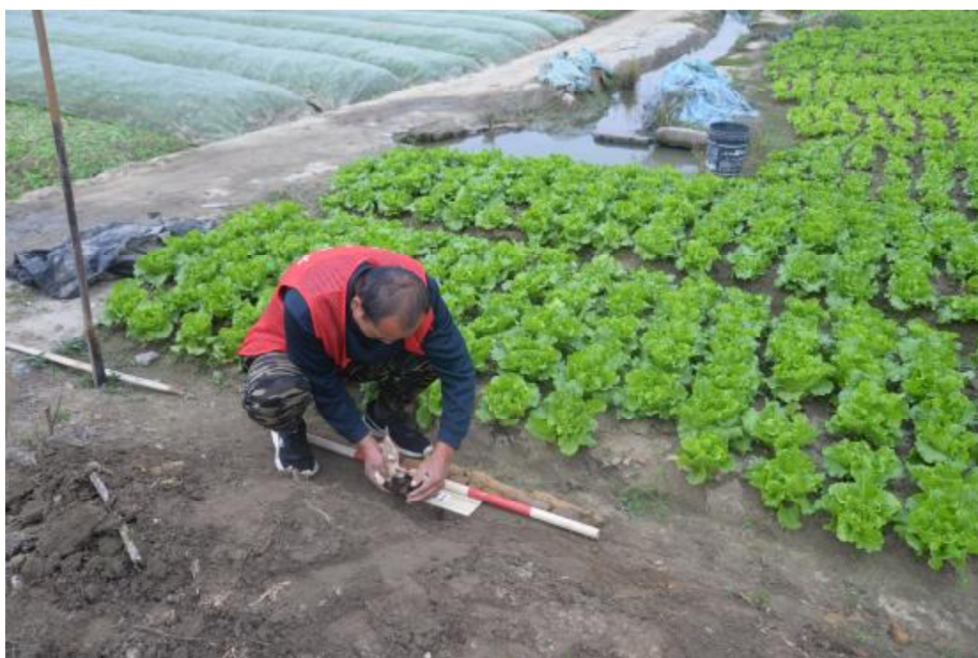
图 32 试探孔土样GPS数据测量（西-东）