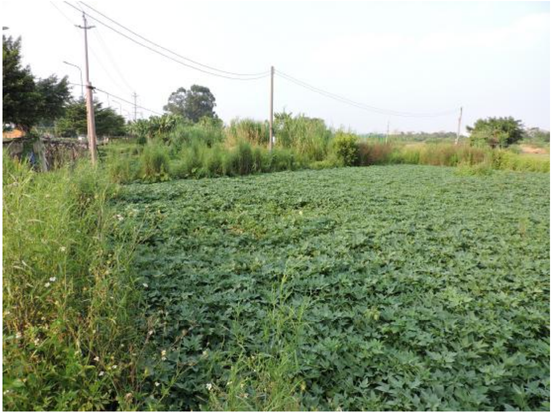
图 24 地表现状（南—北）