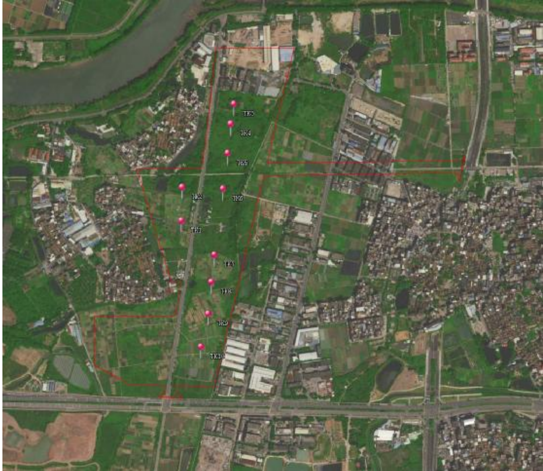
图 28 试探孔分布示意图

根据地形地貌及考古调查的工作需要，为了进一步了解并掌握该地块内地层堆积情况，我们在地块范围内进行试探，共选取10个标准型试探孔，编号为TK1-TK10（具体信息详见附表1），列举TK1-TK10介绍如下：