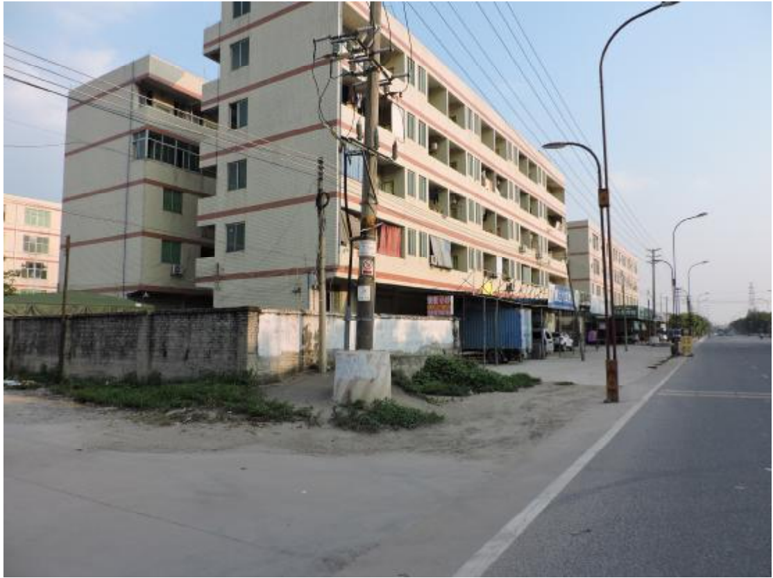
图 20 地表现状（北-南）