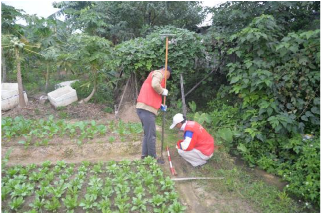
图 30 试探孔土样提取（北-南）