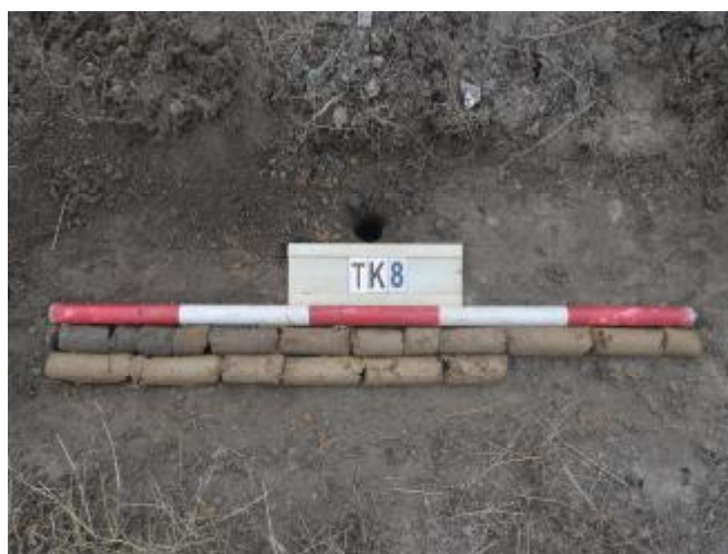
图 40 TK8土样 (一米标杆, 土样由左上往右下)

①层: 现代回填土层, 距地表深约0-0.9米, 厚约0.9米, 为灰褐色沙土, 土质疏松, 含植物根系、粗沙粒等; 以下为黄褐色细沙, 土质纯净、致密, 系生土。