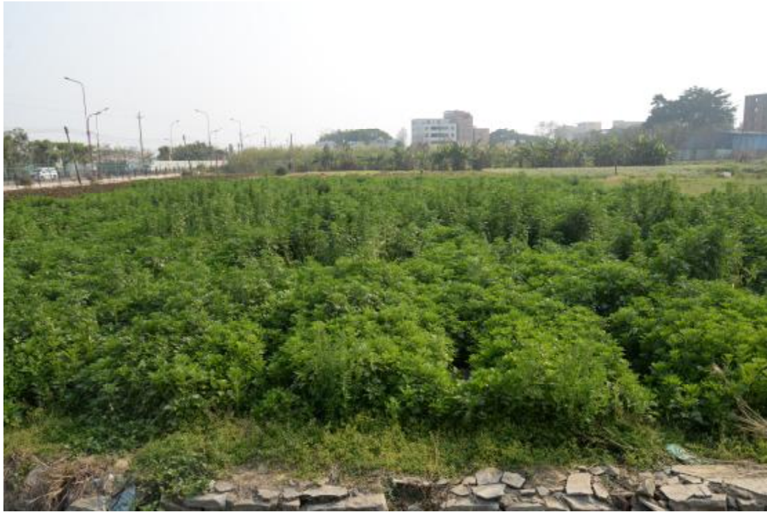
图 16 地表现状（北-南）