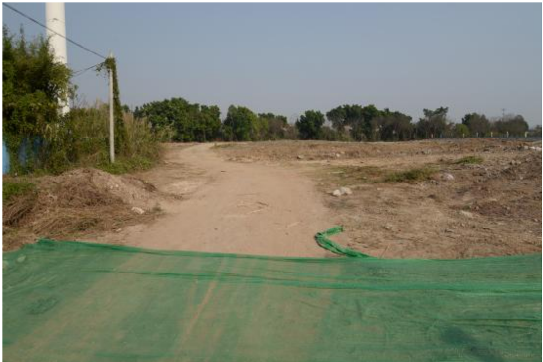
图 9 地表现状（西—东）