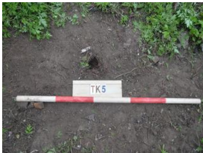
图 37 TK5土样（一米标杆，土样由左往右）

①层：现代回填土层，为灰褐色沙土，土质疏松，含植物根系、砖块等；探至0.15米，石块阻拦，无法提取土样。