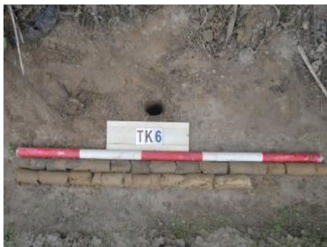
图 38 TK6土样（一米标杆，土样由左上往右下）

①层：现代回填土层，距地表深约0-0.8米，厚约0.8米，为灰褐色沙土，土质疏松，含植物根系、粗沙粒等；以下为黄褐色细沙，土质纯净、致密，系生土。