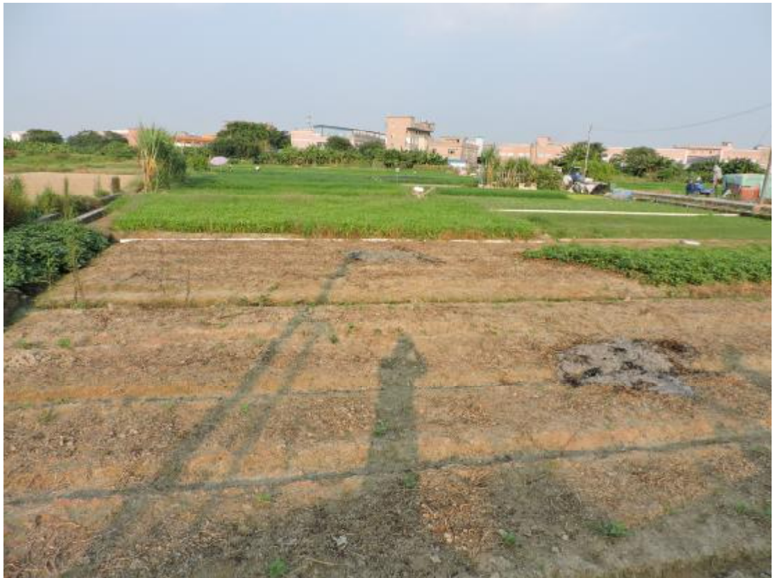
图 21 地表现状（东-西）