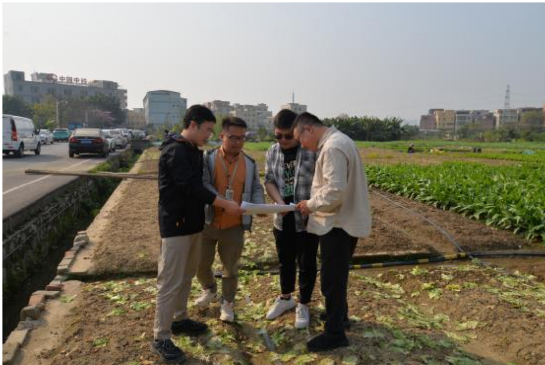
图 5 工作人员确认地块范围（东-西）