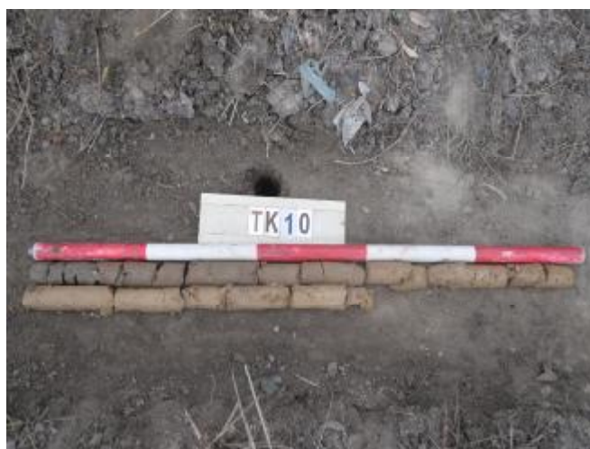
图 42 TK10土样（一米标杆，土样由左上往右下）

②层：沙土层，距地表深约0.2-0.8米，厚约0.6米，为黄褐色细沙，土质较疏松，含植物根茎等；以下为黄褐色黏土，土质纯净、致密，系生土。