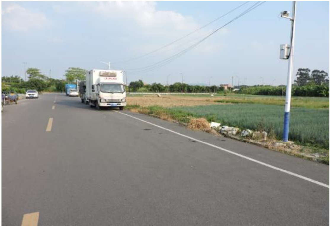
图 27 地表现状（西-东）