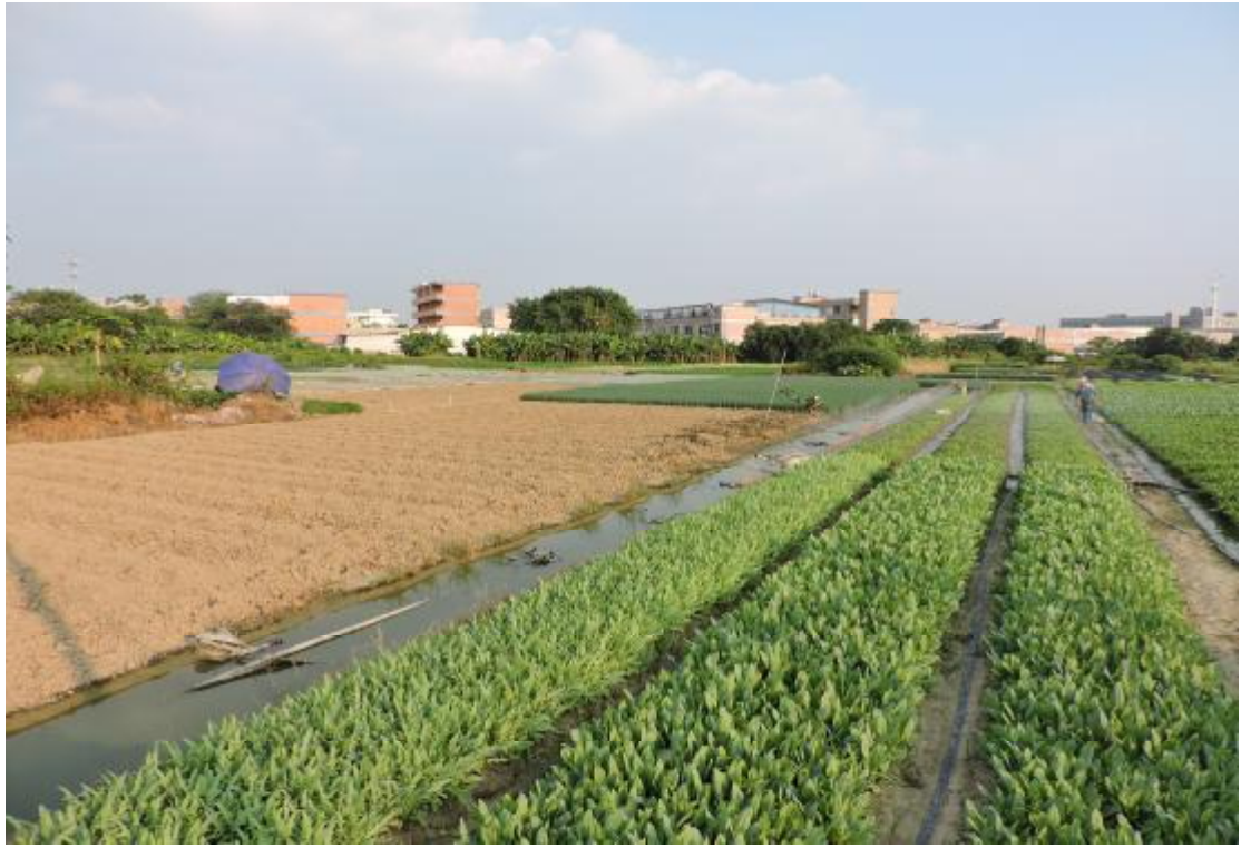
图 26 地表现状（北-南）