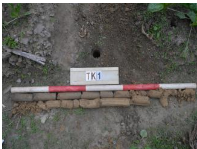
图 33 TK1土样（一米标杆，土样由左上往右下）

①层：现代回填土层，距地表深约0-0.8米，厚约0.8米，为灰褐色沙土，土质疏松，含植物根系、粗沙粒等；以下为黄褐色细沙，土质致密、纯净，系生土。