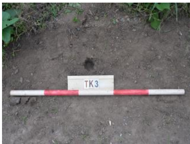
图 35 TK3土样 (一米标杆, 土样由左往右)

①层: 现代回填土层, 为灰褐色沙土, 土质疏松, 含植物根系、粗沙粒等; 探至0.15米, 石块阻拦, 无法提取土样。