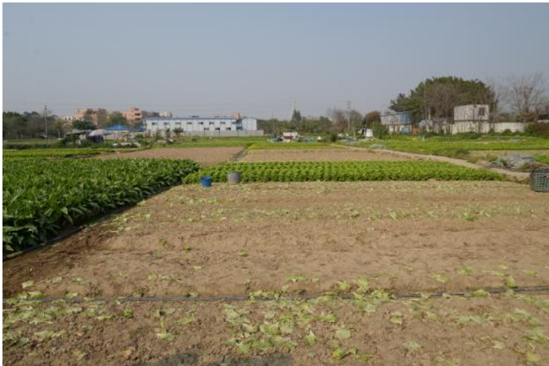
图 7 地表现状（南-北）