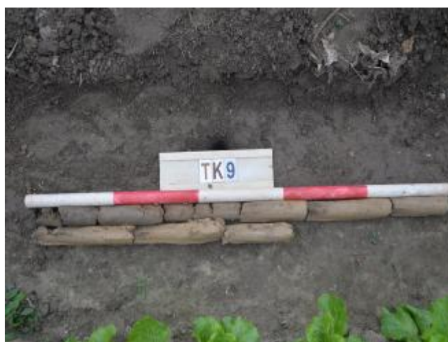
图 41 TK9土样（一米标杆，土样由左上往右下）

②层：沙土层，距地表深约0.2-0.6米，厚约0.4米，为黄褐色细沙，土质较疏松，含植物根茎等；以下为黄褐色黏土，土质纯净、致密，系生土。