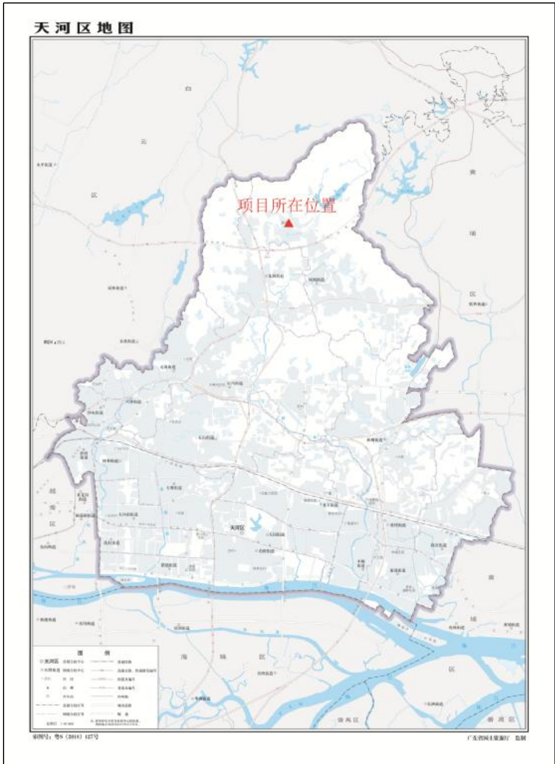
图 2 地块在天河区位置示意图（标准地图）