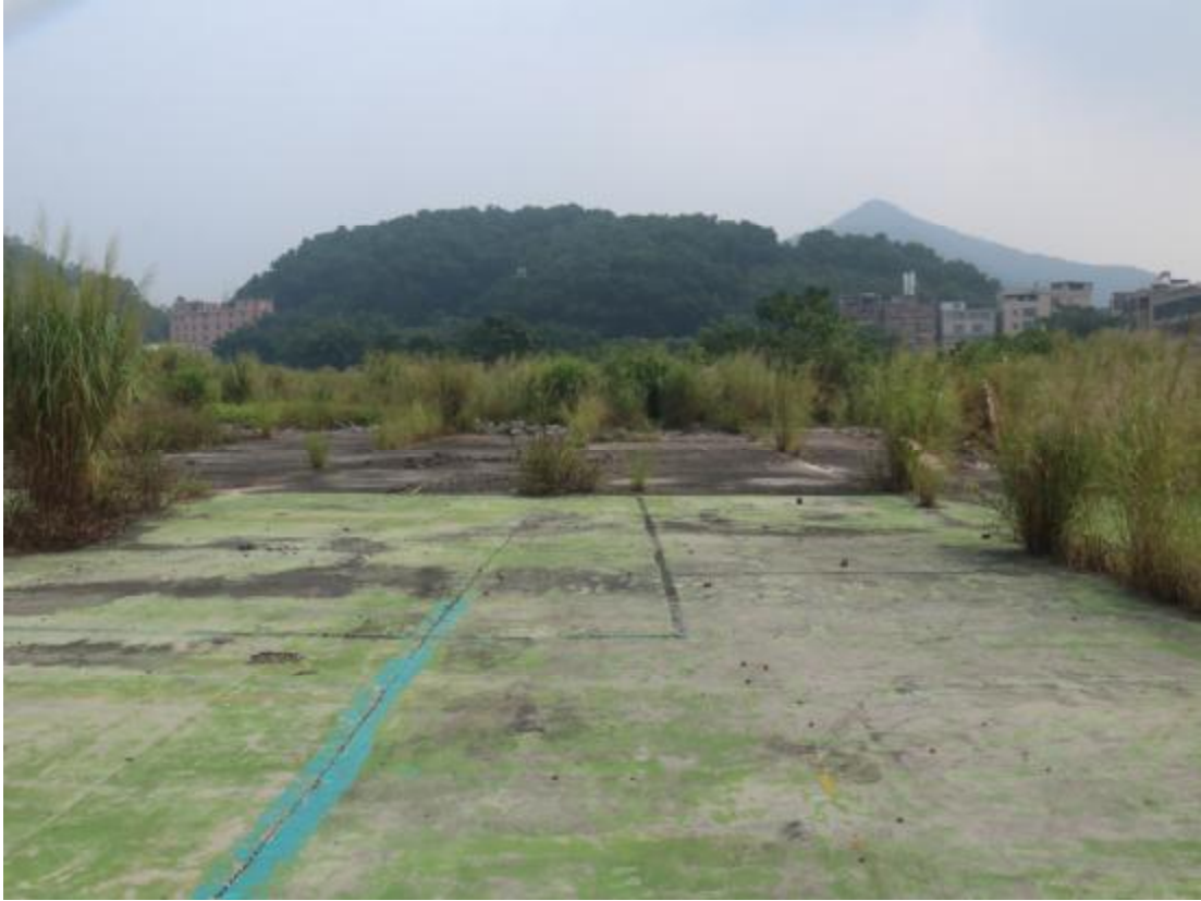
图 16 地块中部地貌（西-东）