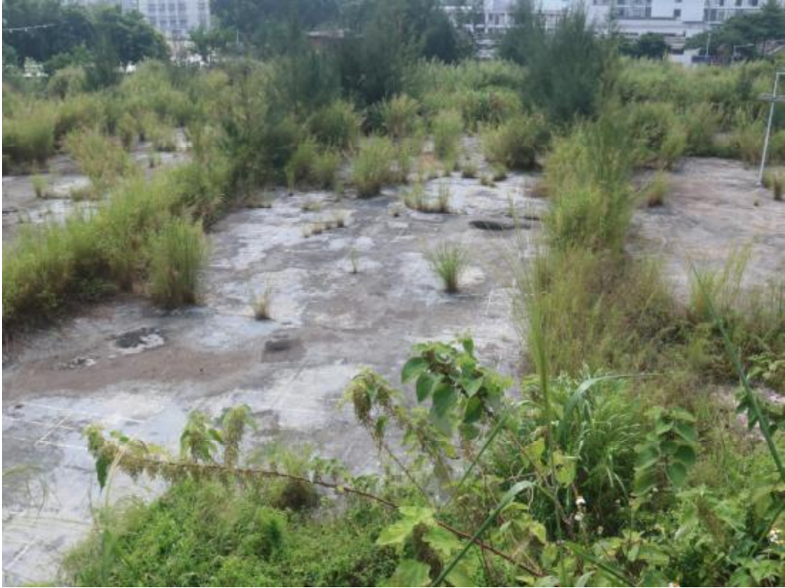
图 14 地块西部地貌（北-南）