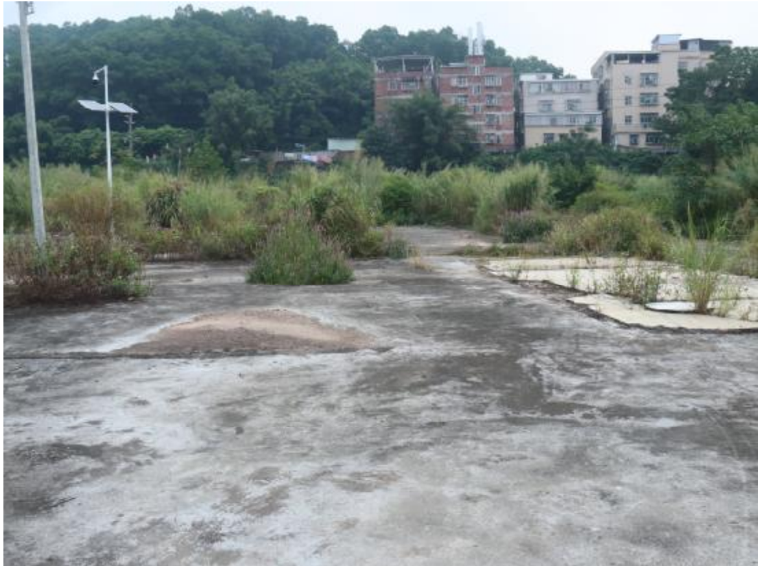
图 19 地块东部地貌（西-东）