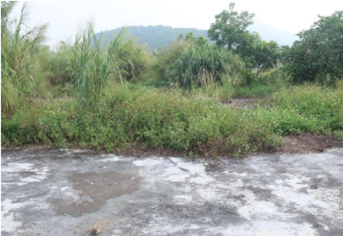
图 11 地块西部地貌（东-西）