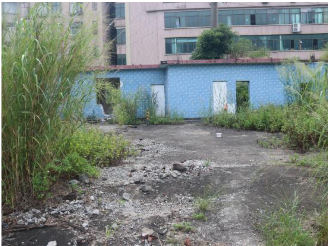
图 21 地块东部地貌（北-南）