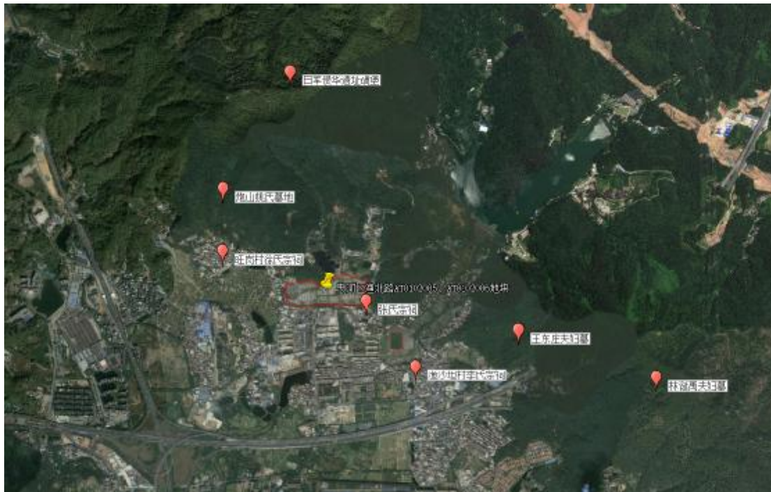
图 6 地块周边文物资源分布图（黄点为项目位置）

根据文物普查汇编资料记载，地块周边不可移动文物资源丰富，现选取日军侵华遗址碉堡、苏隆兴夫妇合坟墓、林诞禹夫妇墓、李氏宗祠做详细介绍。