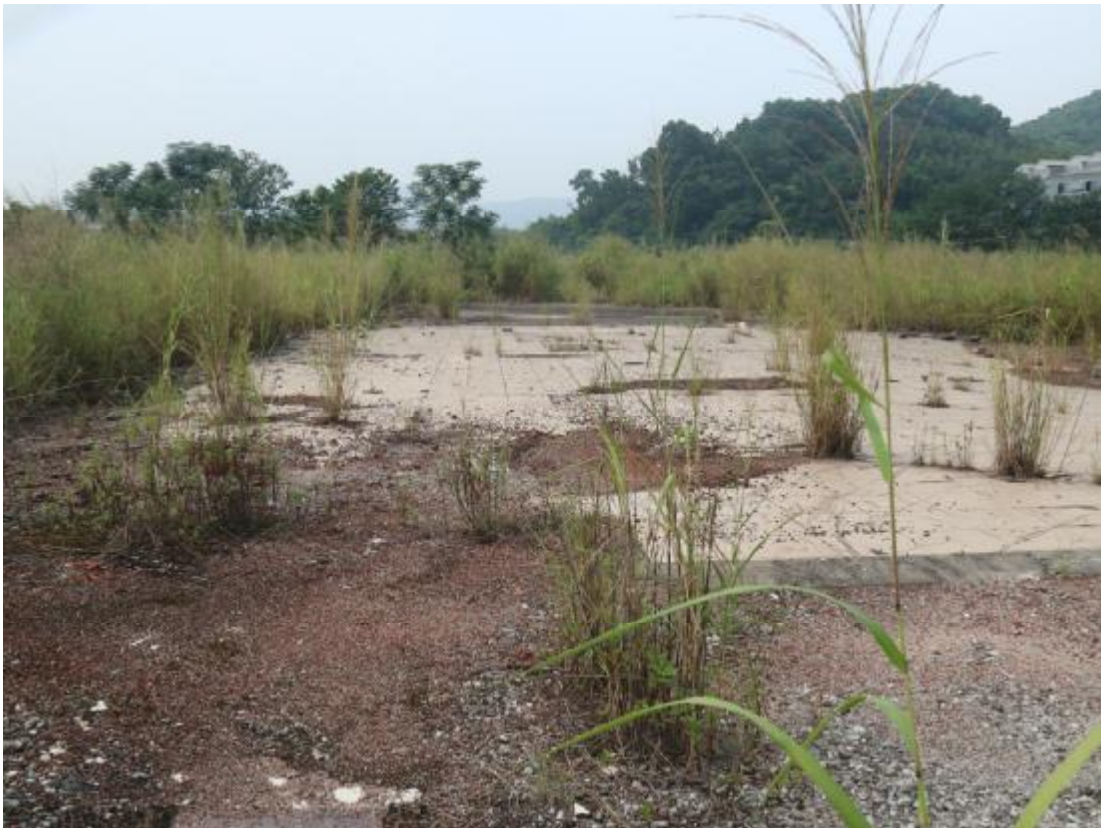
图 23 地块东部地貌（东-西）