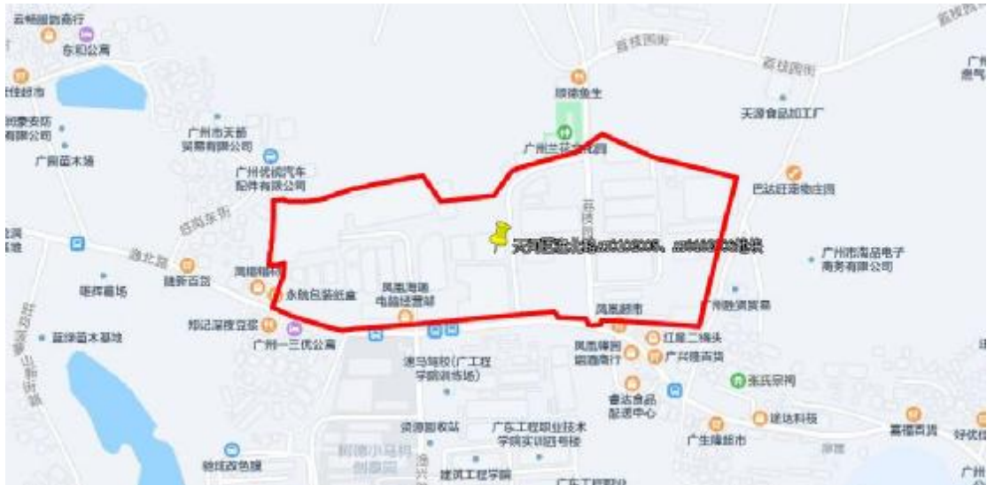
图 3 地块周边环境示意图（腾讯地图）