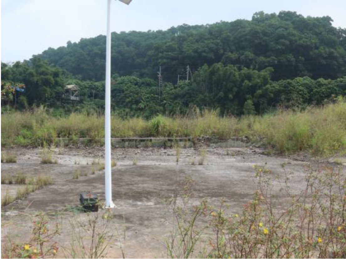
图 22 地块东部地貌（南-北）