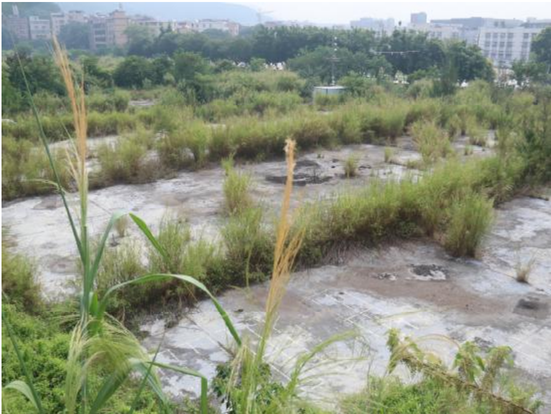
图 15 地块西部地貌（西北-东南）