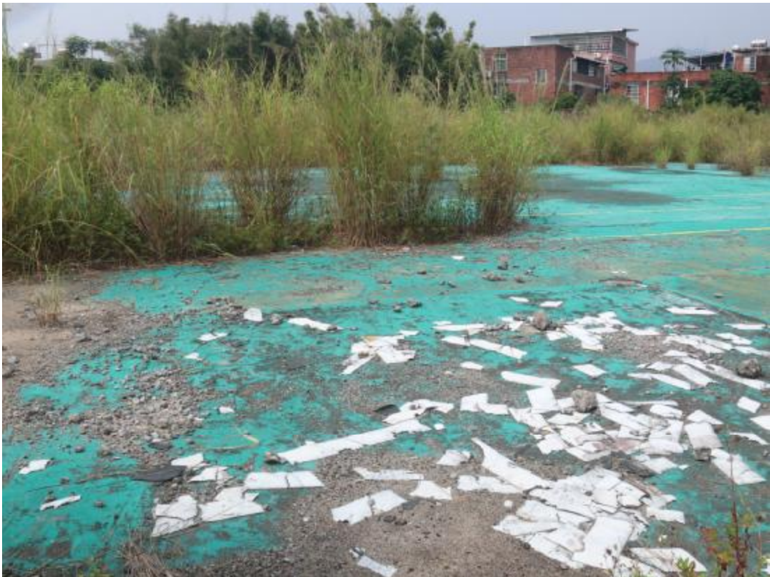
图 13 地块西北部地貌（东南-西北）