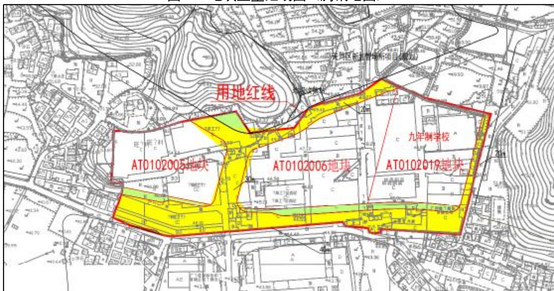
图 5 地块红线地形图（甲方提供）