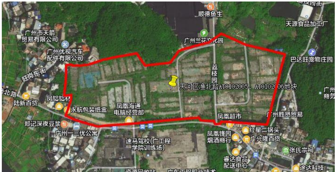
图 4 地块卫星红线图（腾讯地图）