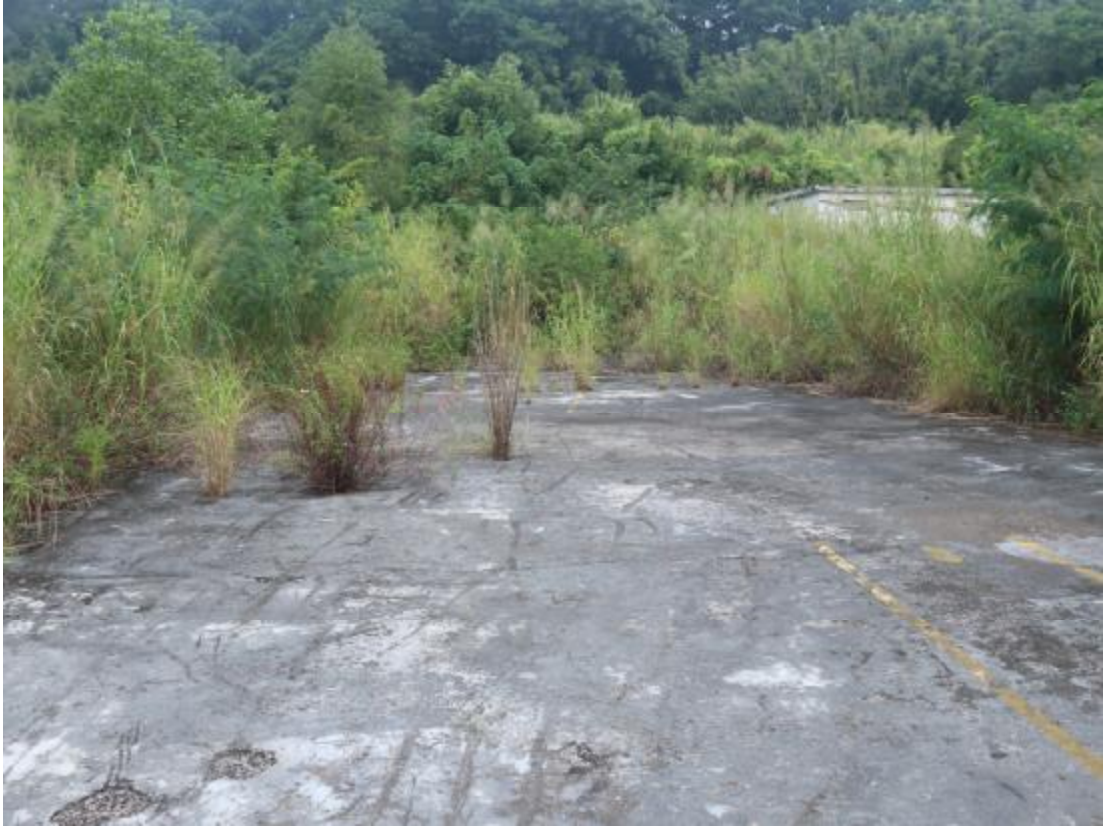
图 10 地块西部地貌（南-北）