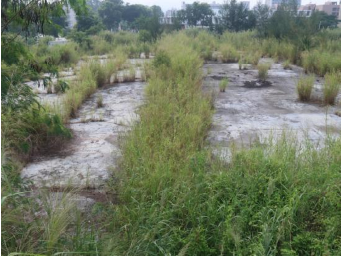
图 12 地块西部地貌（西-东）