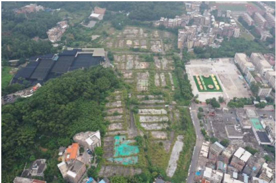
图 9 地块全景航拍（上为东）