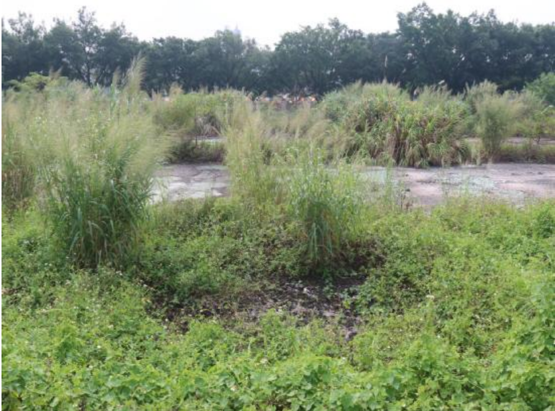
图 17 地块中部地貌（南-北）