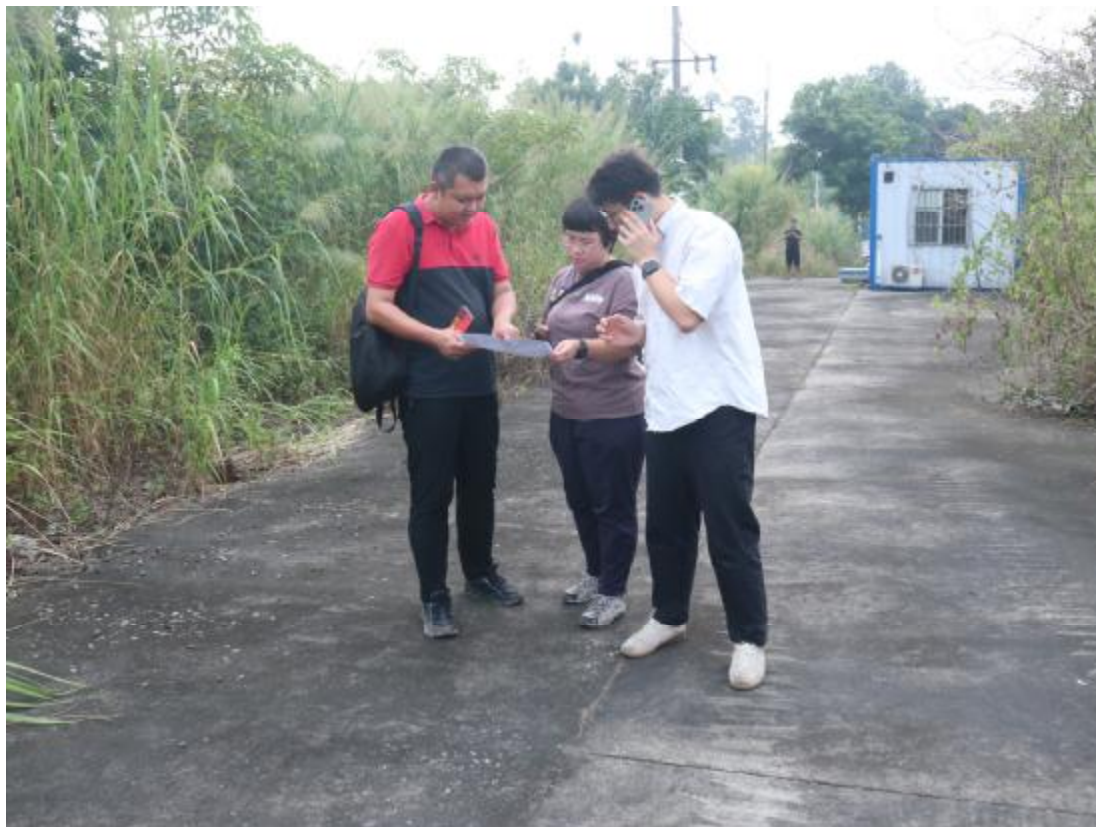
图 7 工作人员确认地块范围（北-南）