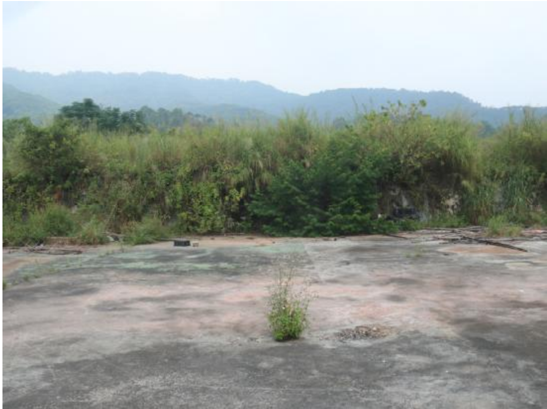
图 20 地块东部地貌（南-北）