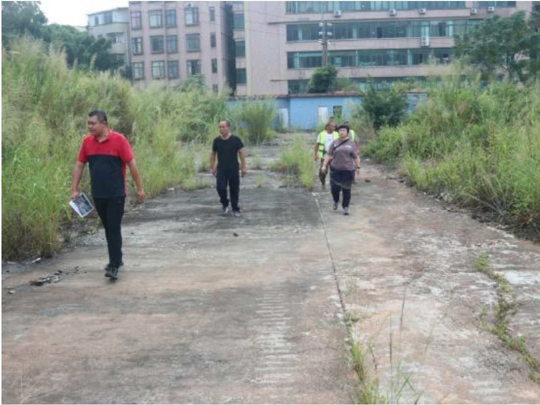
图 8 工作人员现场踏查（北-南）