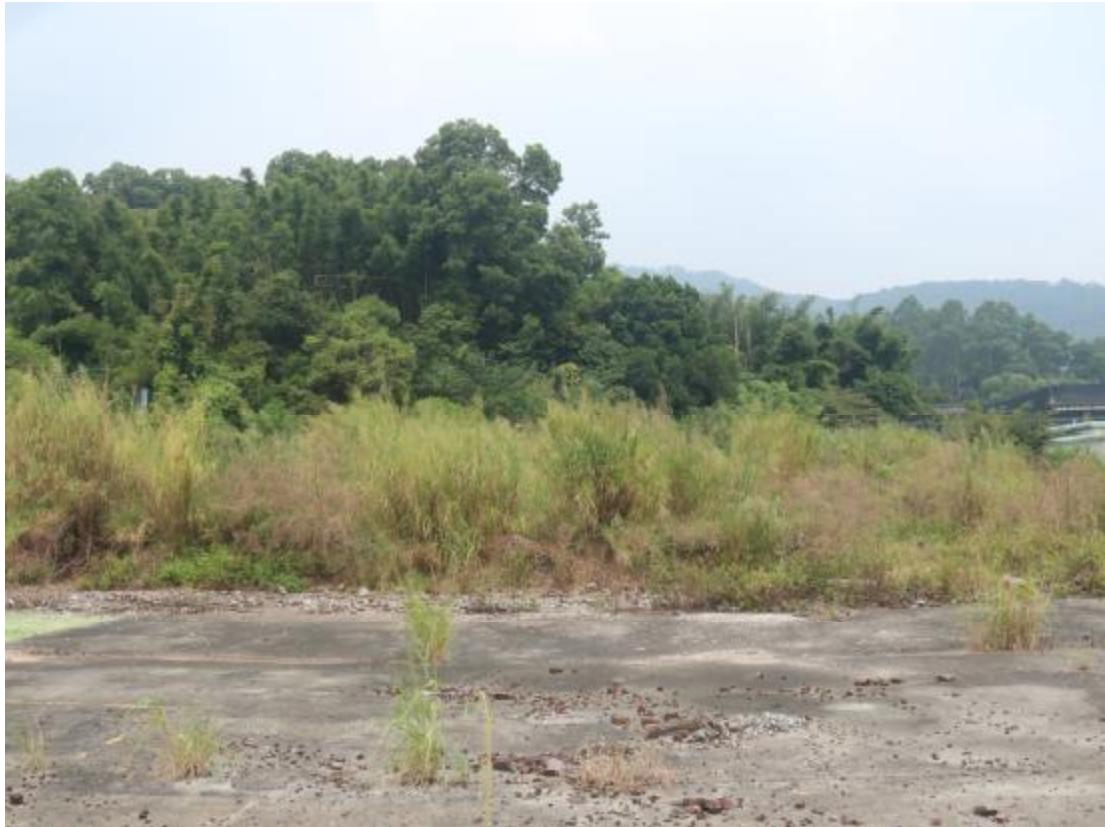
图 18 地块中部地貌（东-西）