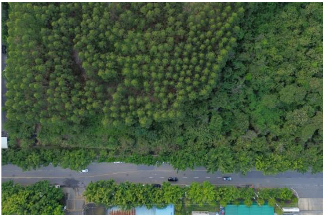
图 10 地块内东部现状（上西北-下东南）