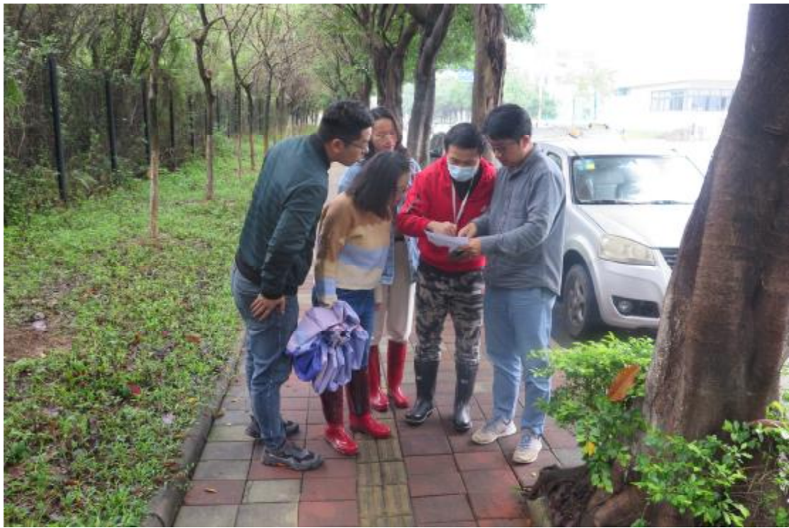
图 6 工作人员确认地块范围（南-北）