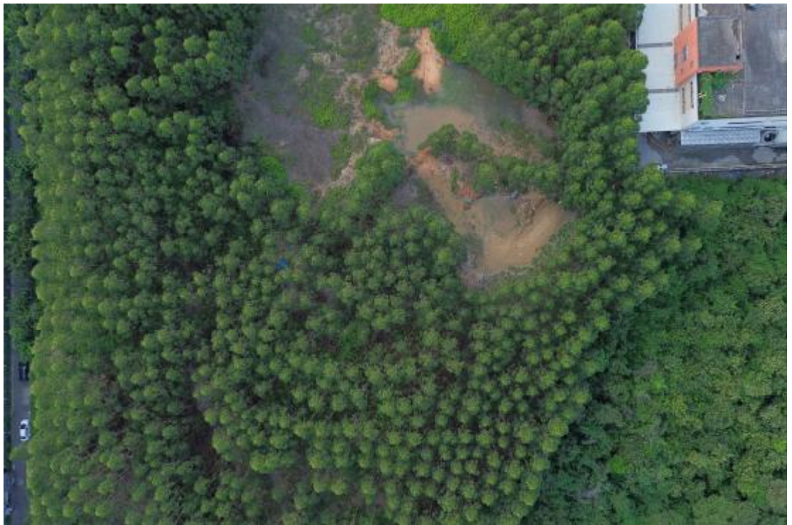
图 12 地块内东部现状（上西北-下东南）