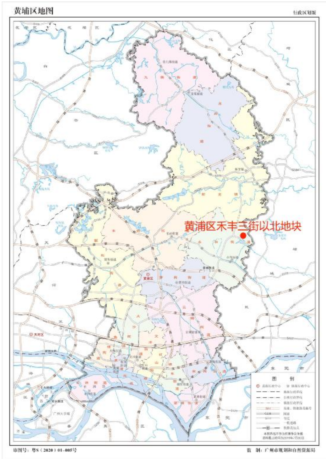
图 2 项目地块在黄埔区位置示意图（广州市规划和自然资源局）