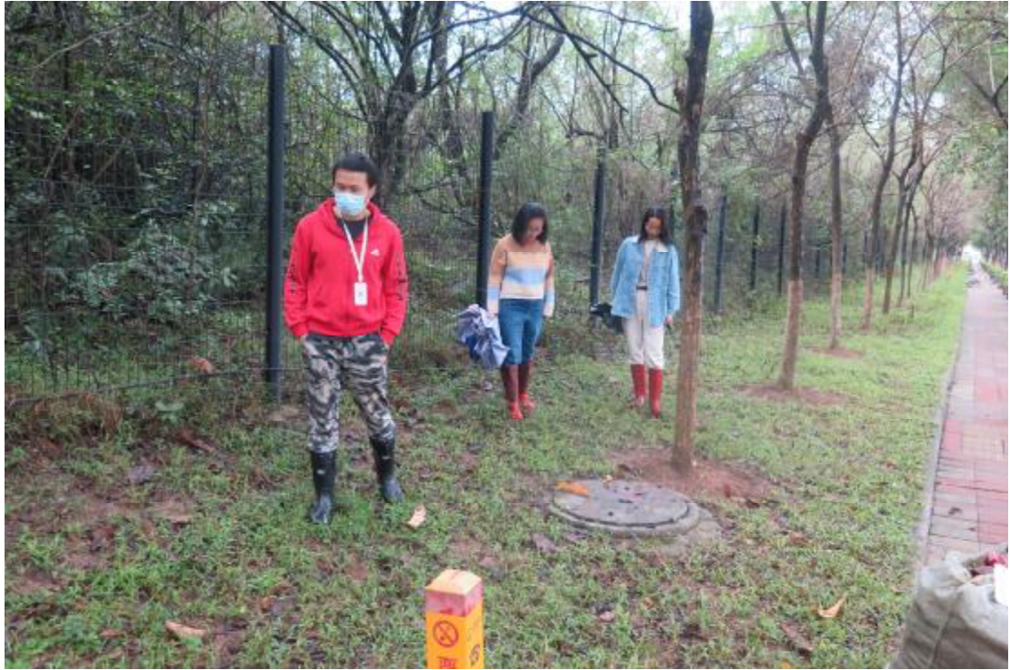
图 7 现场踏查（南-北）