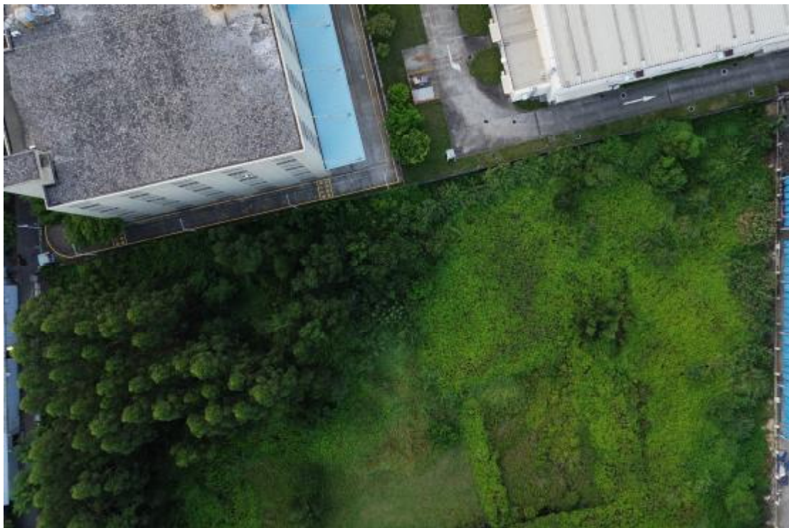
图 16 地块内西部现状（上西北-下东南）