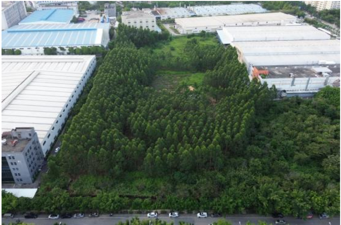
图 8 地块全景航拍图（东南-西北）