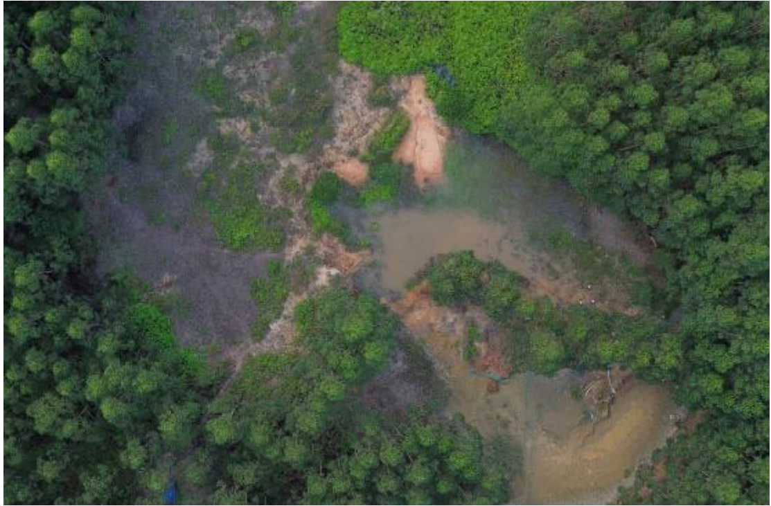
图 13 地块内中部现状（上西北-下东南）