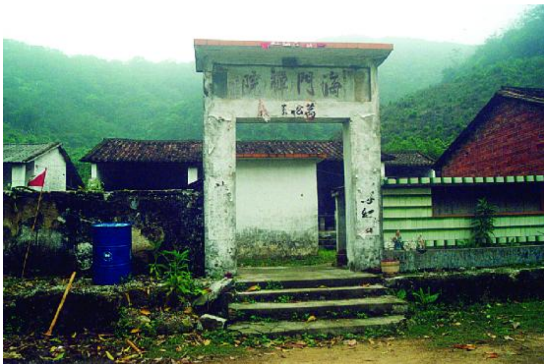
图 5 华峰寺门前匾额

2022年7月26日至28日，9月26日至30日、10月12-10月18日，广州市文物考古研究院对永丰路以北地块和永丰路以北地块二进行了考古调查勘探工作，在地块内地表发现5座近代墓葬，且大部分在近期有祭拜的痕迹。除此之外，未发现其他古代文化遗存。