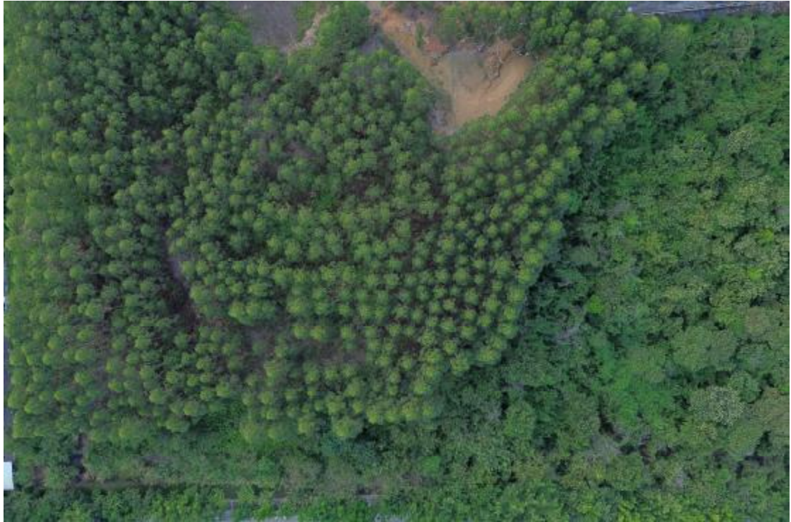
图 11 地块内东部现状（上西北-下东南）