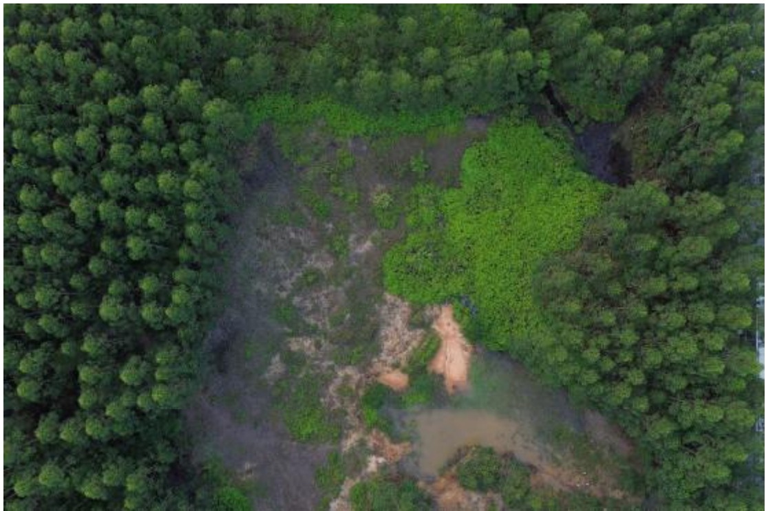
图 14 地块内中部现状（上西北-下东南）