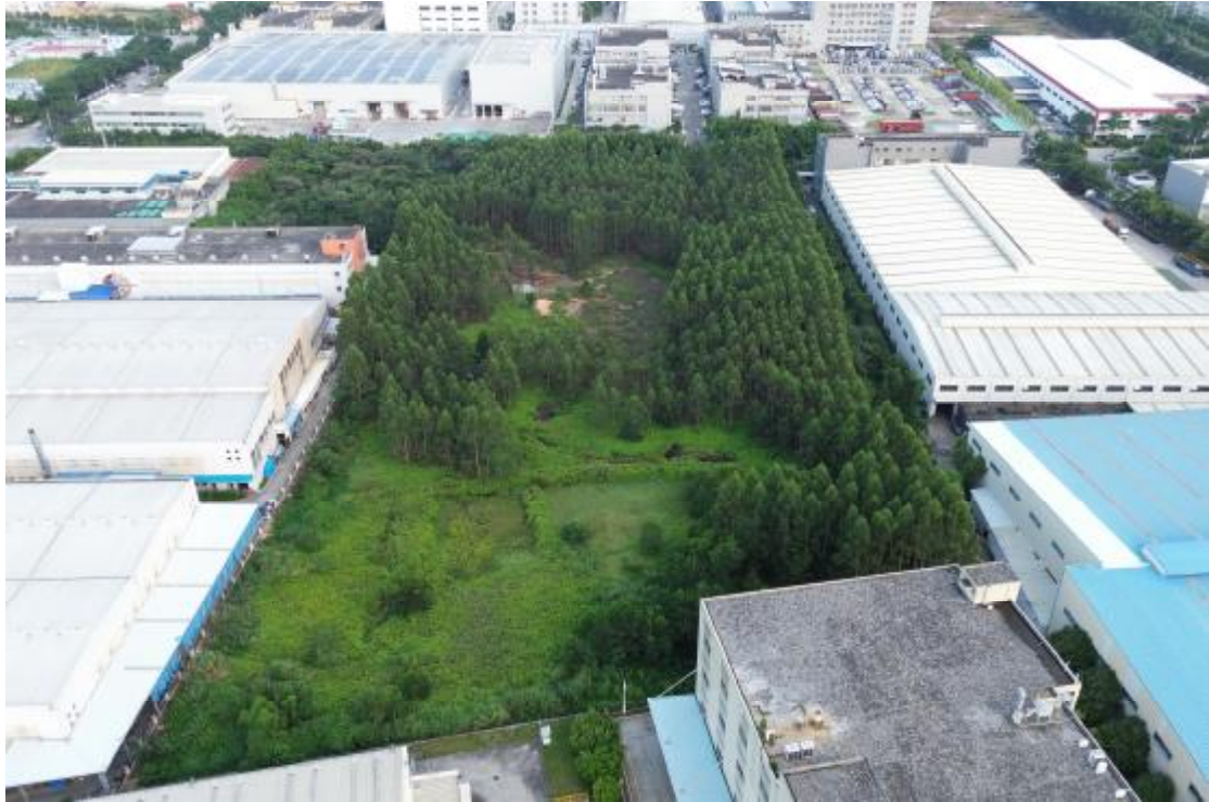
图 9 地块全景航拍图（西北-东南）