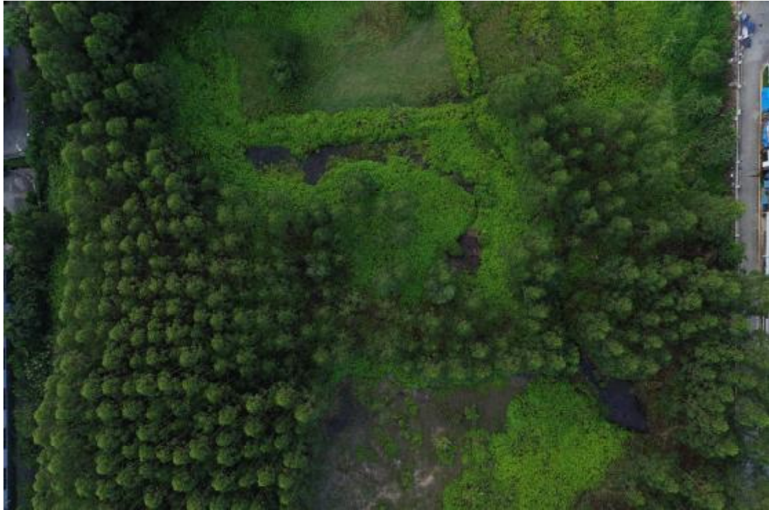
图 15 地块内西部现状（上西北-下东南）